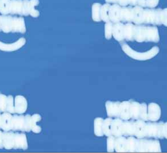
بورغه برنده رئيس المنتدى الاقتصادي العالمي

• في وقت يشهد العالم ازدهار السياسات القومية والانكفائية، ألا تخشون أن يصبح منتدى دافوس مُهمّشاً؟