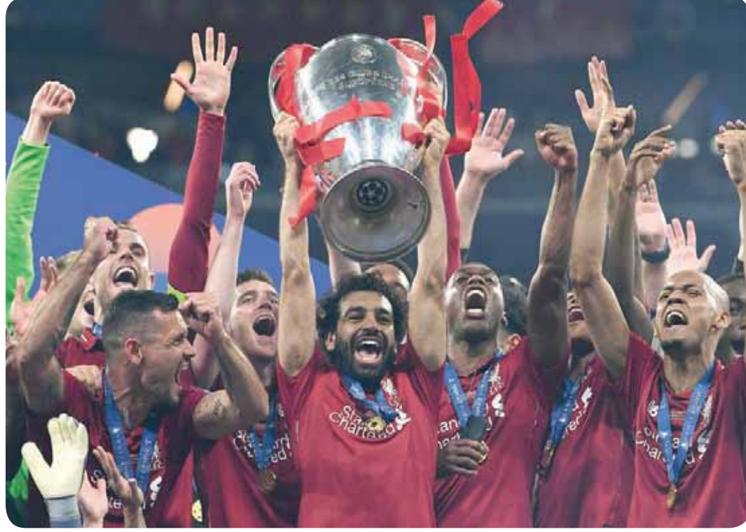
فريق ليفربول لحظة تتويجه ببطولة دوري أبطال أوروبا صيف 2019

وتحت ليفربول نفسه، لا سيما على ملعب أنفيلد، كفريق يحلق خارج المنافسة محلياً هذا الموسم، إذ تعود خسارته الأخيرة في الدوري الممتاز إلى الثالث من يناير 2019 أمام مانتشستر سيتي (1 - 2)، ومنذ تلك المباراة، لم يعرف ليفربول طعم الخسارة.