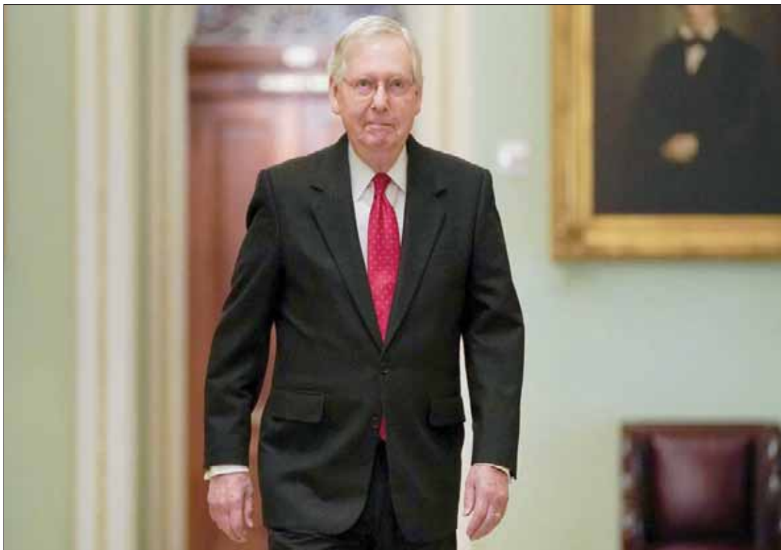
ثارت ثائرة الديمقراطيون عندما قرر الجمهوري ميتش كونيل زعيم الأغلبية في مجلس الشيوخ حصر عرض أدلة الادعاء على مدى يومين فقط (رويترز)

واشنطن، رفا أبتّر صوت مجلس الشيوخ لتحديد أطر محاكمة الرئيس الأميركي دونالد ترمب التاريخية، وحدد المجلس 24 ساعة لفريق الادعاء، المؤلف من النواب السبعة المعيّنين من قبل رئيسة مجلس النواب نانسي بيلوسي، و24 ساعة لفريق الدفاع عن ترمب، المؤلف من محاميه الخاص جاي سيكولو ومحامي البيت الأبيض بات سيبولون وغيرهم. وشارت ثائرة الديمقراطيون، فقد قرر الجمهوري ميتش كونيل، زعيم الأغلبية في مجلس الشيوخ، حصر عرض أدلة الادعاء على مدى يومين فقط، ما يعني أن المجلس سينعقد على مدى 12 ساعة متواصلة كل يوم، وسيؤدي بالتالي إلى عرض بعض الأدلة، في وقت متأخر للغاية من المساء، وقد وصف زعيم الأقلية الديمقراطية تشاك شومر، مشروع تخليط المحاكمة، بالعار الوطني، قائلًا إن «القوانين التي طرحها كونيل تختلف كلياً عن قوانين محاكمة كلينتون. وهي تهدف لمنع مجلس الشيوخ والأميركيين من الاطلاع على حقيقة تصرفات الرئيس ترمب، التي أدت إلى عزله.