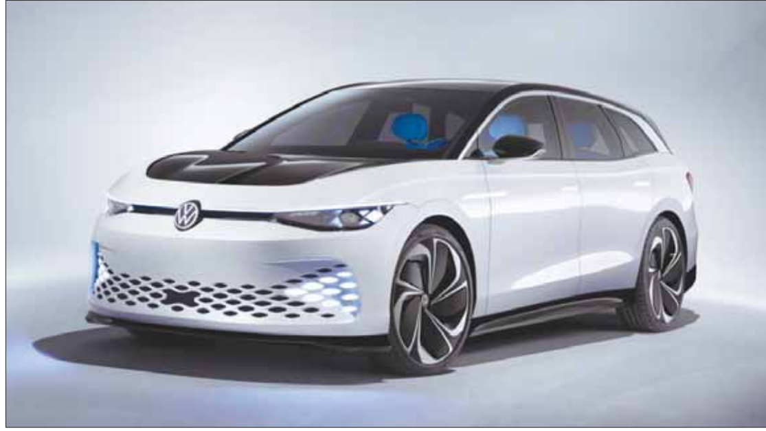
سيارات فولكسفاغن «أي دي» الكهربائية في الأسواق هذا العام

ندن، الشرق الأوسط، تحت ضغوط أهداف نظافة البيئة التي وضعتها أوروبا لنفسها بداية من عام 2020، سوف تنتقل صدارة التحول إلى السيارات الكهربائية من الصين إلى أوروبا خلال العام الجاري، وفقاً لتقرير عن تحولات عالم الطاقة من مؤسسة «بلومبرغ». من ناحية تحاول أوروبا خفض البث الكربوني بينما تخفض الصين من الدعم الذي تقدمه للسيارات الكهربائية. ويشير تقرير «بلومبرغ» إلى أن الصناعة سوف تنتج هذا العام 2,5 مليون سيارة كهربائية، بزيادة 20 في المائة على إنتاجها في العام الماضي. وبينما تستمر الصين كأكبر سوق في العالم للسيارات الكهربائية، فإن زخم النمو سوف يكون في