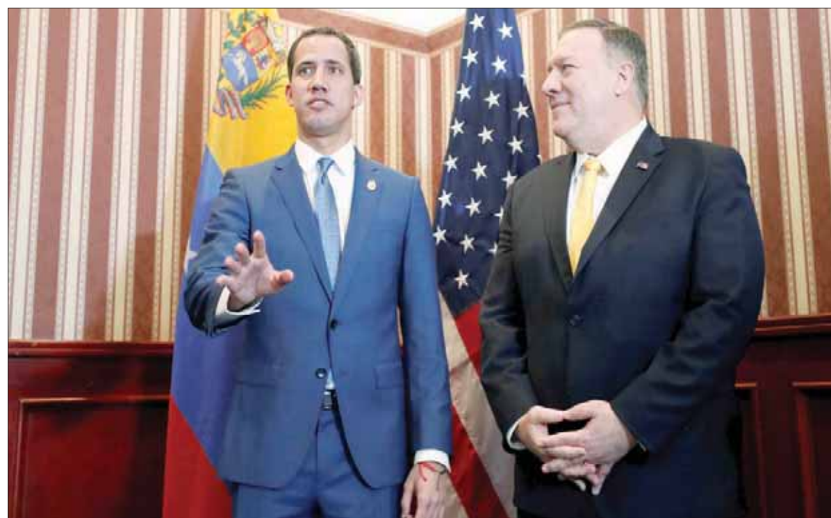
خلال قمة مكافحة الإرهاب في بوغوتا اجتمع غوايدو بوزير الخارجية الأميركي مايك بومبيو (أ.ب.أ)

للتجديد ولبايتة كرئيس للجمعية الوطنية. ويذكر أن الاجتماع الأخير الذي عقده وزراء خارجية الاتحاد الأوروبي في بروكسل كان قد ناقش الأزمة الفنزويلية وقرر عدم توسيع العقوبات المفروضة على نظام مادورو، لكن بوريل أصر على عقد اجتماع عاجل لفريق الاتصال الدولي الذي كان الاتحاد الأوروبي قد دعا إلى تشكيله منذ نحو سنة بهدف التوسط لحل الأزمة الفنزويلية، والذي يضم بوليفيا وكوستاريكا والإكوادور وفرنسا وإيطاليا وألمانيا وهولندا وباناما والبرتغال وإسبانيا والسويد والمملكة المتحدة. وينطلق بوريل في هذه الدعوة من اعتباره أن الأزمة الفنزويلية تحتل حالياً في سلم أولويات الاتحاد الأوروبي المرتبة الثانية بعد المواجهة بين إيران والولايات المتحدة.