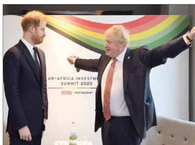
الأمير هاري مع بوريس جونسون رئيس الوزراء البريطاني في لندن

وقال الأمير هاري، خلال حفل عشاء خاص في جمعيتها الخيرية بالعاصمة لندن يوم