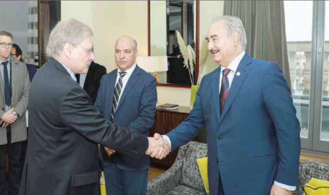
المشير خليفة حفتر خلال لقائه سفير أميركا لدى ليبيا ريتشارد نورلاند في برلين مساء أول من أمس

استمر لليوم الثاني على التوالي خرق هدنة وقف إطلاق النار في العاصمة الليبية طرابلس، أمس، بين قوات الجيش الوطني بقيادة المشير خليفة حفتر، والقوات الموالية لحكومة «الوفاق» برئاسة فائز السراج، التي خاض بعضها اشتباكات جانبية مساء أول من أمس، في ضواحي طرابلس ضد «المرتزقة السوريين» الموالين لتركيا، في وقت حذرت فيه مؤسسة النفط الليبية من خسائر مادية فادحة في حال استمرار وقف إنتاجه وتصديره.