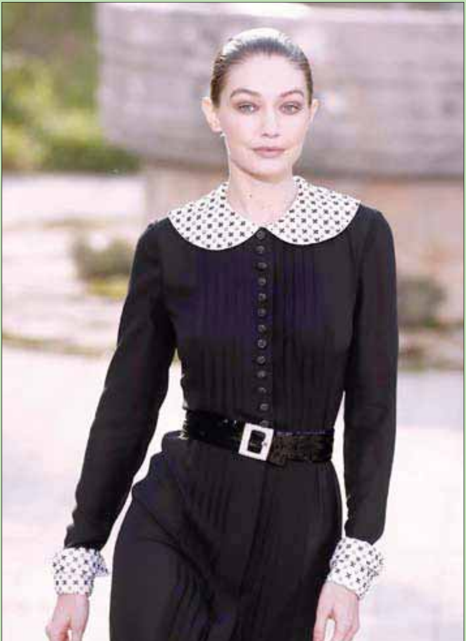
عارضة الأزياء الأميركية جيجي حديد تقدم لمار الأزياء شانيل من تصميم الفرنسية فيرجيني فيارد خلال أسبوع الموضة في باريس

في اليوم التالي لتلقى الجارات العزيمات عند جارة أخرى. لا أحد يتغير. والسيدة قارئة الفئجان واحدة: تقلب الفئجان بأصابعها وتتأمل الأشكال التي رسمتها بقايا البن، ثم تبدأ في السرد: قدامك إشارتان. قدامك طريق. قدامك رزقة. أنا، للأسف، لا أتابع أخبار تشكيل الحكومات في لبنان. أعرف من زمان أنها ليست أكثر من «عصرية» عند الجارة، ومن ثم قدامك إشارتان. ومنذ أكثر من شهر وكبار السياسيين يعلنون أن «الوزارة هاليومين». وأنا والحمد لله مرتاح، ومتخذ قرار يبالأ أقرأ حرفاً عن «التوقعات» بانتظار صدور التشكيلة الرسمية. كل ما عدا ذلك حتى جارات. حتى الآن تم طرح أربعة أسماء لتشكيل الحكومة وفي النهاية تكلف رجل من خارج كل الترشيحات، هو الدكتور حسان دياب. كما يقول اللبنانيون في متاهاتهم، أكتب هذه السطور صباح الثلاثاء، وقد تولّف الحكومة اليوم أو غداً أو بعد غد. أي بالصري، بكر أو بعد بكر، أو بعد بكر. وسوف نقرأ أسماء كثيرة، بعضها ذاتي الترشيح، وبعضها يكتبني من الترشيح بما يكتبه أصدقاؤه من المحللين، وبعضها لعل وعسى. أهم الأشياء عند العنصر البشري، أي الوقت، هو أرخصها عندنا خصوصاً، وعند سائر العرب بصورة عامة. لبنان من حضيض إلى حضيض والأحزاب متقاتلة على حقيبة أو حقيبتين. ليس الأحزاب المعارضة بل الحاكمة. بعد ذلك يتساءل الناس، لماذا الثورة وعلى من. ويتساءلون لماذا يُطرّد السياسيون من المطاعم والأماكن العامة، ولماذا يهتف مئات الآلاف في الشوارع والساحات طالبين إسقاط جميع الطبقة السياسية: «كلّ يعني كلّ». فحين لا يبقى شيء يجب ألا يبقى أحد.