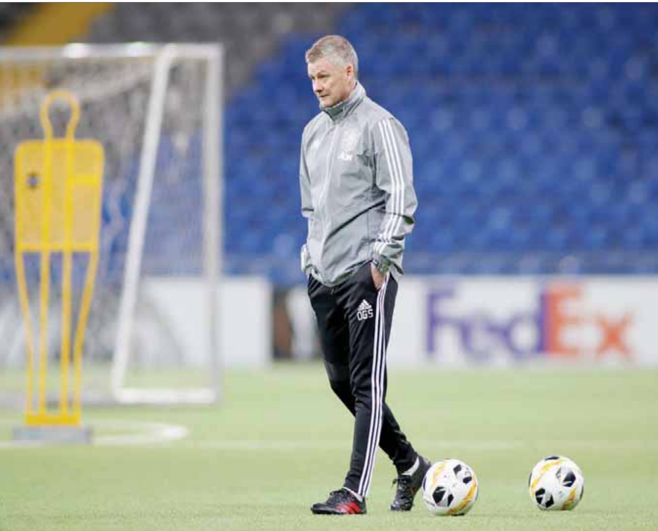
سولسكاير ما زال واثقاً في قدرته على تحسين نتائج يونائيد

وأبدى مورينيو رغبة في ضم الجزائري إسلام سليمان، مهاجم ليلستر سيتي المعار لموناكو الفرنسي، وذلك خلال فترة الانتقالات الشتوية الجارية، لتعويض غياب كين. وكان سليمان قد انضم إلى ليلستر سيتي في عام 2016، قادماً من سبورتنغ لشبونة البرتغالي، مقابل 29 مليون جنيه إسترليني، وهو رقم قياسي في تاريخ النادي حينها، حيث سجل 13 هدفاً في 46 مباراة خاضها معه، قبل إعارته إلى موناكو مطلع الموسم الجاري، بعد أن سبق له الانتقال على سبيل الإعارة لنادي نيوكاسل يونائيد وفنارغيشة التركي. ومنذ انضمامه إلى موناكو، سجل سليمان 7 أهداف في 11 مباراة شارك بها مع الفريق. وذكرت صحيفة «تليغراف» البريطانية، أمس، أن مورينيو يحاول تعويض غياب كين في أسرع وقت. ويستضيف ليلستر (ثالث الترتيب) فريق وستهام يونائيد (السادس عشر) اليوم أيضاً، بعد أن كان الأول قد تعرض لهزيمة مفاجئة أمام مضيفه بيرنلي الأحد، وبيات يتبعه بفارق 19 نقطة عن ليفربول. وتختتم منافسات المرحلة غداً، بلقاء ليفربول (المختصر) الذي لا يزال رصيده خالياً من الهزائم في 22 مباراة خاضها حتى الآن في الدوري هذا الموسم، مع وولفرهامبتون.