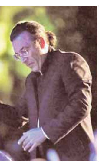
المايسترو أندريه الحاج يقدم حفل «ويبقى الوطن» في 23 الحالي بالجامعة اليسوعية

هذه الأوقات بالذات إلى نوع موسيقى يرضي عليهم راحة نفسية يحتاجون إليها. «لقد تفاجأت بالإقبال الذي يبديه الناس لحضور هذا الحفل. فهم مشتاقون، كما أوضح لي غالبيتهم بأخذ فكرة استراحة والانفصال عن الواقع الذي يعيشونه من خلال فسحة موسيقية كلاسيكية». ومن المقطوعات الموسيقية التي يتضمنها حفل «ويبقى الوطن»، واحد لزياد الرحباني «أثار على الرمال»، التي رافقت أحد المسلسلات اللبنانية في منتصف السبعينات كشارة موسيقية. ولاقت يومها نجاحاً كبيراً ولا تزال أصدائها تتردد حتى اليوم. ومن الأعمال الأخرى التي يشهدها الحفل ودائماً مع زياد الرحباني «قد يشق كان في