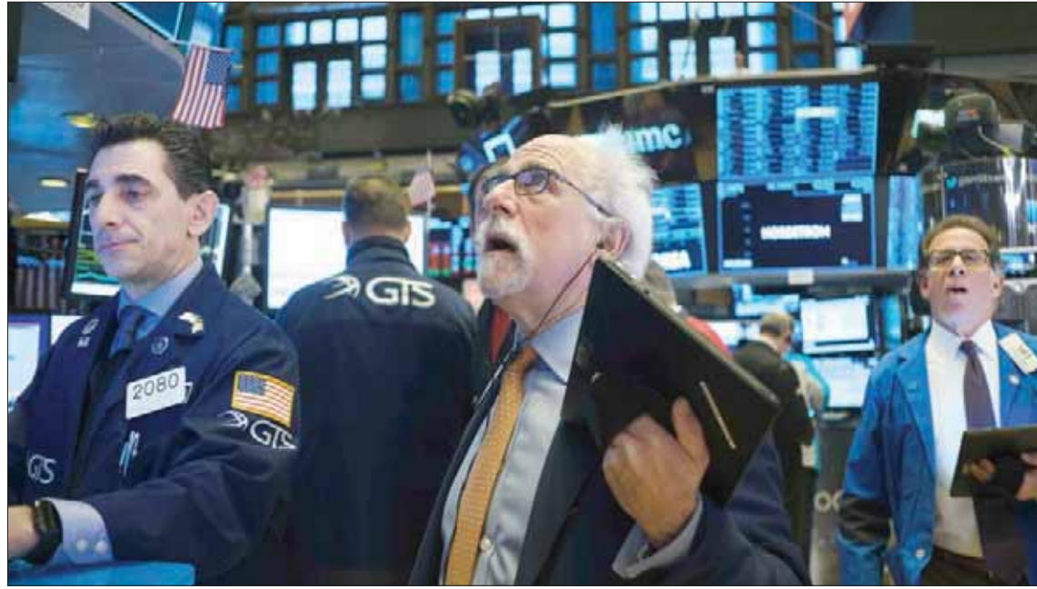
تراجعت المؤشرات الرئيسية للأسهم الأمريكية عند الفتح أمس ليتعثر صعود قياسي ليورصة «ول ستريت»