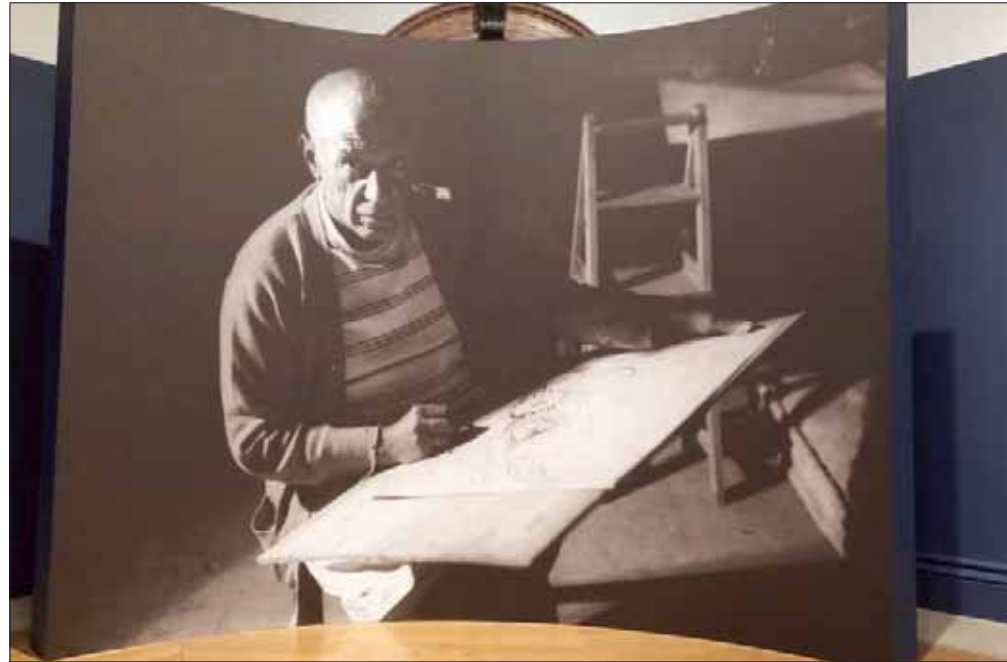
بيكاسو يرسم في أنتيب عام 1945