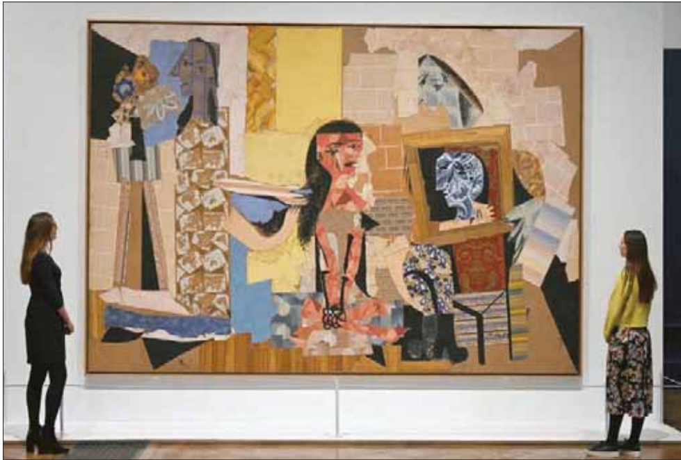
لوحة «نساء يتزين» ضمن معرض «بيكاسو والورق» في رويال أكاديمي بلندن