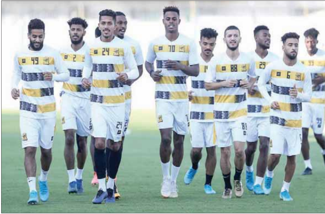
لاعبو الاتحاد في تدريباتهم الأخيرة