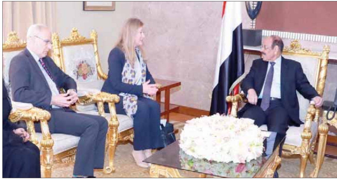
نائب الرئيس اليمني الفريق الركن علي محسن الأحمر خلال استقباله أمس مسؤولاً قسم شبه الجزيرة العربية في وزارة الخارجية البريطانية هيلين ونترتون وسفير المملكة المتحدة مايكل أرون

قوله إنه «يأمل التسريع في تنفيذ بنود اتفاق الرياض وتشكيل الحكومة الجديدة ومن ثم الوصول إلى تشكيل الوفد التفاوضي لضمان الشروع في مفاوضات العملية السياسية الشاملة». وكان غريفيث قد عاد إلى الرياض في سياق مهمته الأممية لإنعاش مسار السلامين الشرعية والمليشيات الحوثية بالتوازي مع وجود حرارك دبلوماسي عربي في الرياض وصنعاء في هذا الخصوص. وذكرت المصادر الرسمية أن نائب الرئيس اليمني علي محسن الأحمر، التقى في الرياض (أمس)، مسؤولاً في الرياض، شدد بن دغر على أهمية تنفيذ بنوده ونصوصه المتفق عليها وبخاصة الالتزام بتطبيق مصفوفة الحلول العسكرية والأمنية والسياسية التي نصت على الانسحابات المتبادلة، وعودة القوات العسكرية إلى المواقع المحددة، وجمع وسحب الأسلحة الثقيلة المشروعة لفئات التزاماتها من الانسحابات، وعلى المجلس الانتقالي الالتزام بتنفيذ ما تم التوقيع عليه للمضي قدماً نحو بقية الخطوات الأمنية والسياسية».