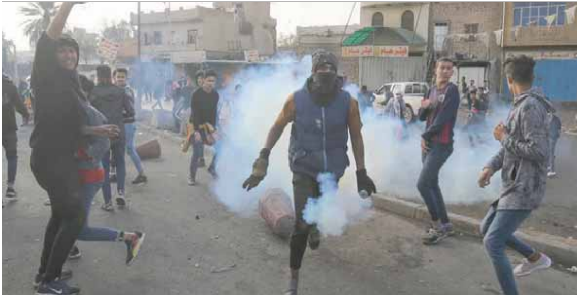
مواجهات بين محتجين وقوى الأمن قرب طريق محمد القاسم في بغداد أمس

الأميركي - الإيراني بعدما قتلوا واشنتن قاسم سليمانى قائد فيلق القدس بالحرس الثوري الإيراني في ضربة جوية داخل العراق.