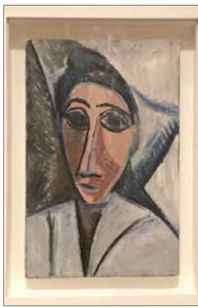
لوحة رأس بحار أو امرأة 1907