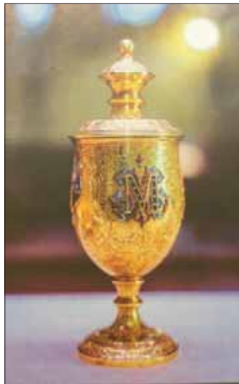
كأس صلب شعر الأميرة ملك طوسون