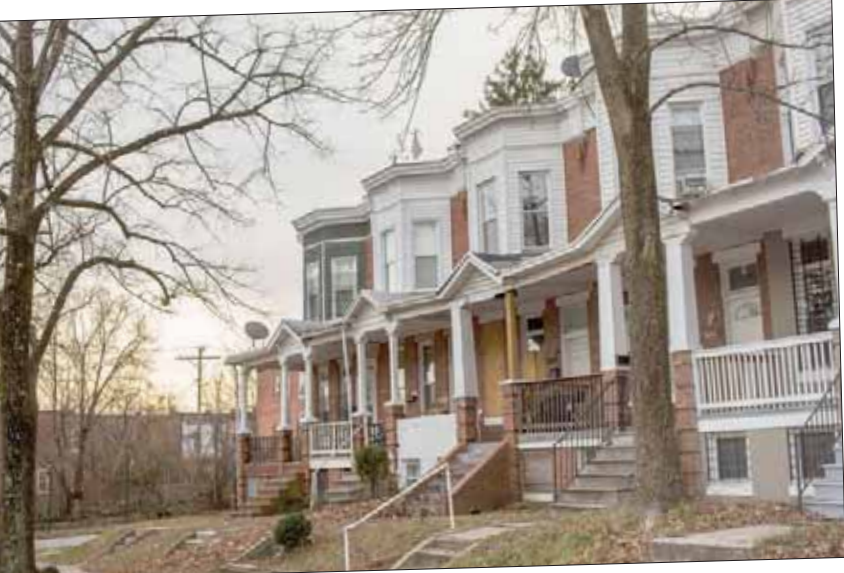
ستقوم «فيجن» بسداد مبلغ 600 ألف دولار كتعويض للمستأجرين وأسره الذين يعيشون حالياً في 58 منزلاً متهاكلاً تملكها الشركة في نيويورك

واجه اتهامات مؤخراً بالاحتيال من قبل منظمين ببورصة الأوراق المالية. وذكرت شركة إف تي إي بيان لها أنها وافقة من أن جميع الدعاوى الجارية مع «فيجن» سيجري حلها بحلول 30 مارس (آذار) وقالت إنها ستطعن في قرار البورصة حذف أسهمها من التداول. وأشار خبراء العقارات إلى أنهم قد خدروا من ممارسات