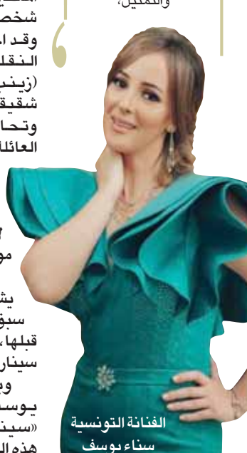
الفنانة التونسية سناء يوسف

تتطلع سناء يوسف لتكرار ما فعلته الفنانة المصرية الكبيرة الراحلة شادية في الجمع بين الغناء والتمثيل.