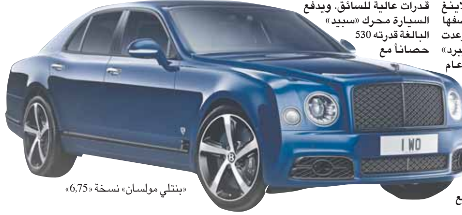
«بنيتلي مولسان» نسخة «6,75»

وتطلق الشركة على مجموعة وداع «مولسان» نسخة اسم «مولسان» نسخة «6,75» نسبة إلى سعة محركها الذي يودع الأسواق معها. ويعد محرك «بنيتلي» من أقدم المحركات في العالم مع