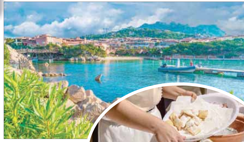
منظر من منطقة أولبيا

اكتشاف جنباتها وأسرارها في رحلات صباحية مبكرة. وتعتبر بيسكيناس في الجنوب الغربي من سردينيا، بكتباتها الرملية البيضاء الناصعة، من الأماكن الأخرى التي لا يجب على السائح تفويتها؛ حيث الحياة البرية الوعرة، وفندق «لا ديون بيسكيناس»، المطل على البحر مباشرة، بمعماره البسيط وموقعه المعزول، إضافة إلى رحلة إلى أنغليو روجو؛ حيث توجد مجموعة كبيرة من «دوموس دي جانوس»، وهي مقابر ما قبل الحقبة النورانية القديمة التي كان يعتقد البعض، حتى وقت قريب، أنها منازل أسطورية خرافية، رغم أنها مقابر قديمة بالفعل.