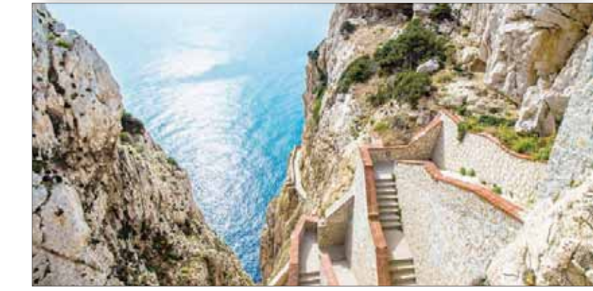
منظر لصخور تكونت منذ آلاف السنين