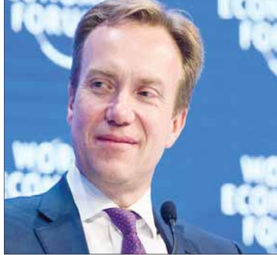
بورغه برنده رئيس المنتدى الاقتصادي العالمي

هذه الظواهر تتغير وفق دورات، لكن صحيح أن المنظمات الدولية والتعاون متعدد الأطراف يواجه معركة صعبة اليوم، وهو ما يطرح تناقضاً كبيراً. ففي عصر العولمة، مشكلات الغير هي مشكلاتنا، كيف يمكننا أن نتجاوز هذه المشكلات دون التعاون. تلوث المحيطات مثال جيد على ذلك، إذ إن البلاستيك الموجود في محيط إحدى الدول، سينتقل إلى الدول المجاورة، ثم إلى المحيط بأكمله... فالتلوث لا يحل جواز سفر!