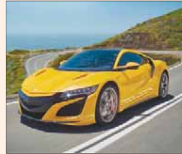
هوندا إن إس إكس

في إحصاء بريطاني عن أفضل السائقين، وفقاً لنوع السيارة، جاء سائقو «فولفو» في المرتبة الأولى بنسبة 75 في المائة، بلا نقاط جزاء على رخص قيادتهم. وحل سائقو سيارات «سوزوكي» و«هوندا» في المراكز التالية. أما أسوء السائقين، فكانوا في سيارات «فورد» و«رينو» و«بيجو» و«سيات».