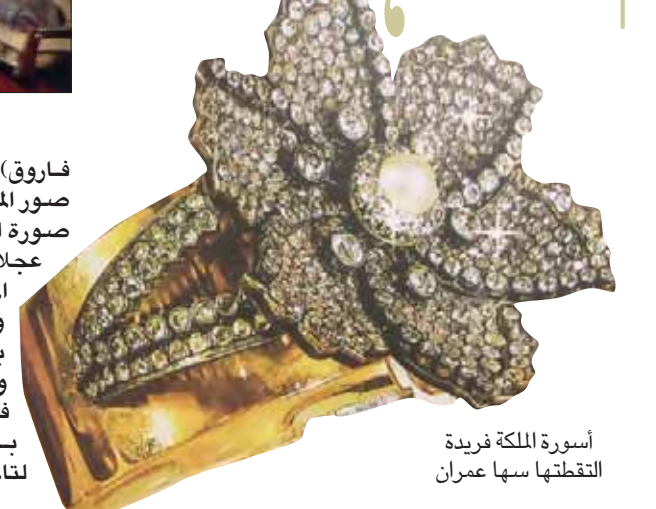
أسورة الملكة فريدة

سلط المعرض كذلك الضوء على قطع شطرنج مميزة للملك فاروق، مصنوعة من الذهب، ومرصعة بالماس الفلمنك على الطراز الهندي، أهديت للملك عام 1939 بمناسبة زواجه من زوجته الثانية الأميرة فوزية.