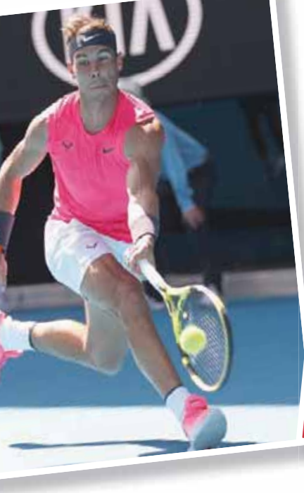
نادال عبر الدور الأول بسهولة

وفي ردها على سؤال لوكالة الصحافة الفرنسية حول عودتها إلى مليونر العام المقبل، قالت شارابوفا: «لا أعلم، لا أعلم. من الصعب جدا أن أجزم ما سيحصل بعد 12 شهرا من الآن. بكل صراحة، لو كنت أعلم الجواب، لقلت لكم، لن أفكر في برنامجي انطلاقاً من هنا». ولم تخرج شارابوفا التي تراجع مستواها كثيراً بعد الإيقاف لـ14 شهراً بسبب المنشطات والإصابات المتلاحقة، من الدور الأول للبطولة الأسترالية منذ عام 2010، لكنها بدأت تتعافى على هذا الأمر في الغراند سلام بعد أن اختبرت هذه الخيبة للمشاركة كإحدى المرشحات للفوز بها على كازاستاكينا 6 - 3 و 6 - 1. وكان اليوم الثاني حزينا بالنسبة لشارابوفا التي خاضت على الأرجح مباراتها الأخيرة في مليونر، حيث توجت بطلة عام 2008 ووصلت إلى النهائي عامي 2012 و2015، إذ انتهى مشوار ابنة الـ32 عاماً عند الدور الأول للبطولة الكبرى الثالثة تواليا خسارتها أمام الكرواتية دونا فيكيتش التاسعة عشرة دون مقاومة 3 - 6 و 4 - 6. وكشفت الروسية الفائزة بخمسة القاب الكبرى، لكن آخرها يعود إلى عام 2014 في رولان غاروس، أنها ليست متأكدة من إمكانية العودة إلى البطولة الأسترالية التي شاركت فيها ببطاقة دعوة.