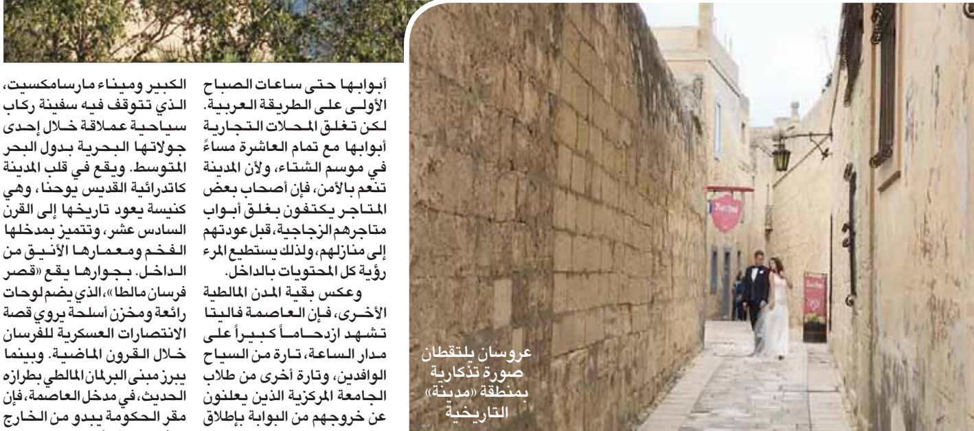
عروسان يلتقطان صورة تذكارية بمنطقة «مدينة» التاريخية

تتميز بمبانيها المميزة الكبير وميناء مارسامكسيت، الذي تتوقف فيه سفينة ركاب سياحية عملاقة خلال إحدى جولاتها البحرية بدول البحر المتوسط. ويقع في قلب المدينة كاتدرائية القديس يوحنا، وهي كنيسة يعود تاريخها إلى القرن السادس عشر، وتتميز بمدخلها الفخم ومعمارها الأنيق من الداخل. بجوارها يقع «قصر فرسان مالطا»، الذي يضم لوحات الأخرى، فإن العاصمة فاليتا تشهد ازدهاراً كبيراً على مدار الساعة، تارة من السياح الوافدين، وتارة أخرى من طلاب الجامعة المركزية الذين يعلنون عن خروجهم من البوابة بإطلاق