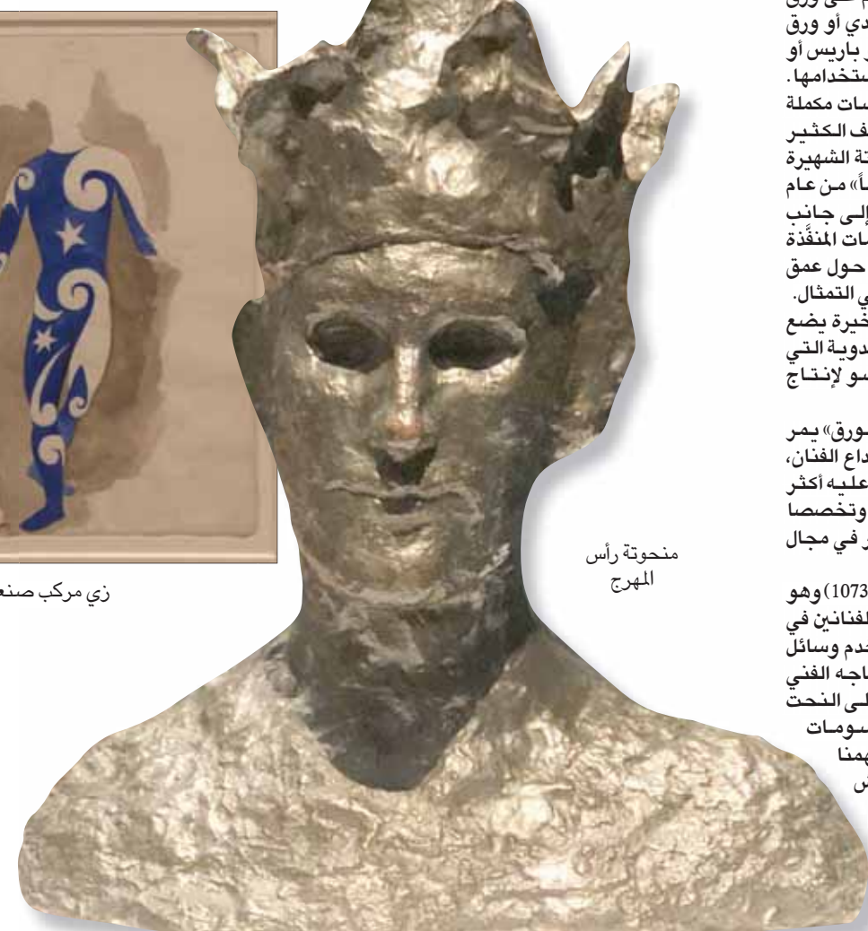
منحوتة رأس المهرج

أنواع الأدوات والألوان «الغواشي» والسوان الباستيل، استخدم الكولاج وقص الورق ثم لصقه، كونه قطعاً مستخدماً أحياناً محروقة مثل مجسم يبدو وكأنه كومة من الورق «المكرمش». ولم يتوقف عند ذلك فهو أيضاً أنتج الصور الفوتوغرافية على الورق كما قضى وقتاً طويلاً في الضخمة التي تشغل حائطاً من الورق.