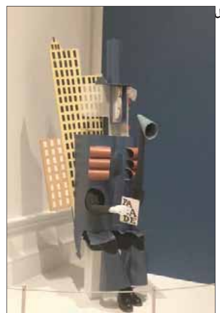
زي مركب صنعه الفنان لترتيبه إحدى الشخصيات في «باليه» (بارايد)

في جانب آخر من القاعة نفسها، نرى زي مركب صنعه الفنان لترتيبه إحدى شخصيات في «باليه» (بارايد) الذي يستعرض رحلة راقصة من حياة فرقة سيرك، صمم بيكاسو خلفيات الديكور المسرحي برسوماته التكعيبية، وصمم أيضاً ملابس الراقصين، ونرى هنا بعضها مرسوماً كما