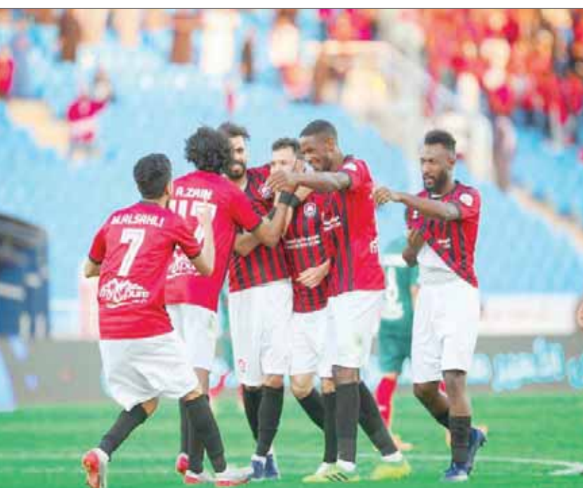
لاعبو الرائد يحتفلون بأحد أهدافهم في الدوري السعودي

وطالب المرشود بحل موضوع الحضور الجماهيري كون النادي تضرر بسبب السعة الكبيرة للمدرجات والتي تستوعب أكثر من 22 ألف مشجع، حيث لا بد أن يكون عدد الحضور 10 آلاف مشجع من أجل الحصول على الملعبين ريال «مكافأة هيئة الرياضة»، حيث حصلنا على ثلاثة ملايين فقط وبعض الأندية سعة ملعبها صغيرة «6 آلاف»، وإذا حضر ثلاثة آلاف يحصلون على الملعبين ريال كنادي الحزم على سبيل المثال.