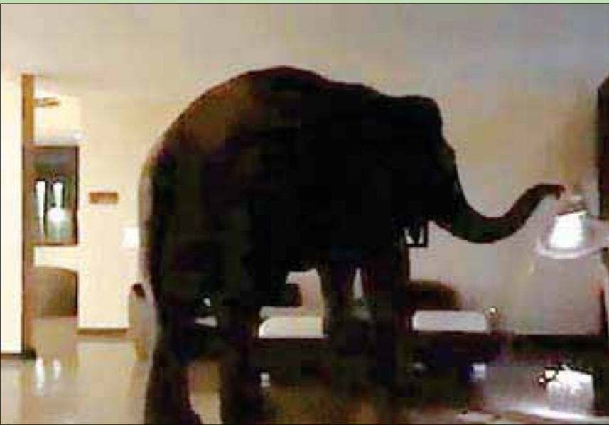
فيلة تتجول في أروقة فندق

وتعتبر الأكثر ولاء في الفندق منذ 2013. وفي السنوات الأولى، كانت