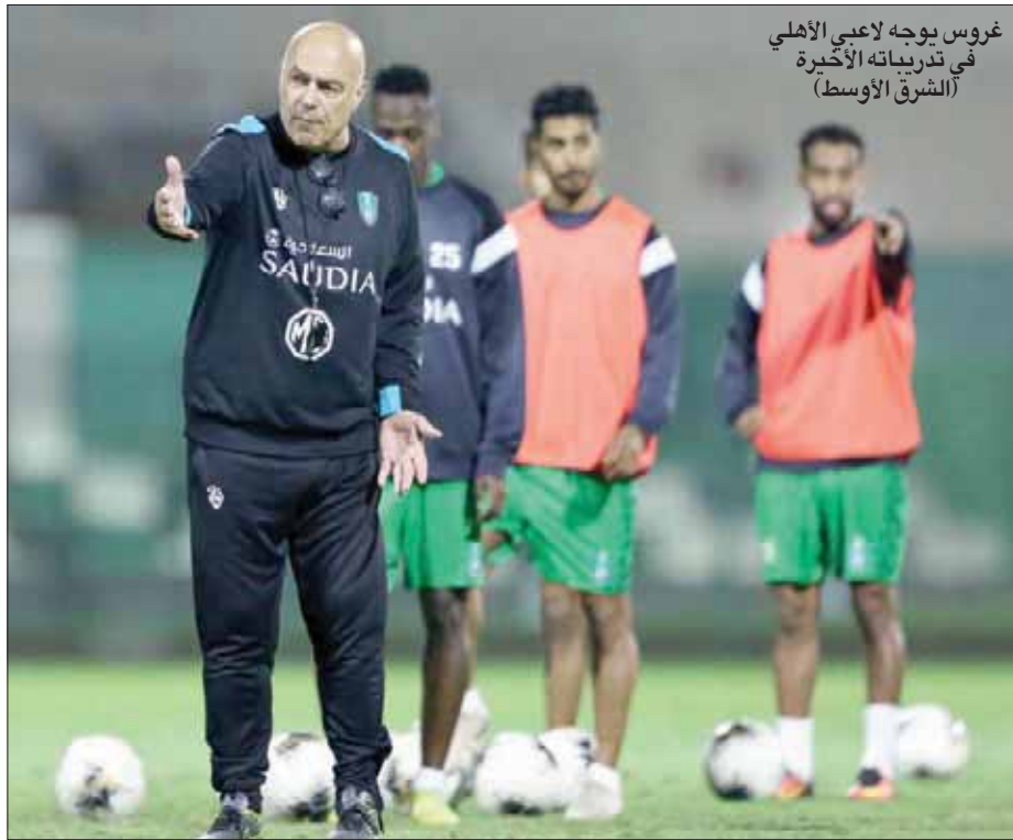
غروس بوجه لاعبي الأهلي في تدريباته الأخيرة

من جهة أخرى تأكد رسميا مواجهة الأهلي لفريق الاستقلال الطاجيكي على ملعب الجوهرة المشعة بمدينة الملك عبد الله الرياضية بجدة في مباراة الملحق الآسيوي يوم الثلاثاء الموافق 28 من شهر يناير (كانون الثاني) الجاري بعد تغلبه أسس على لوكوميتيف الأوزبكي بنتيجة 1 - 0 حيث سيتاهل الفائز من مباراة الأهلي والاستقلال للمرحلة الأولى دوري المجموعات لدوري الأبطال الآسيوي في نسخته الجديدة وتحديدا سينضم لفرق المجموعة الأولى.