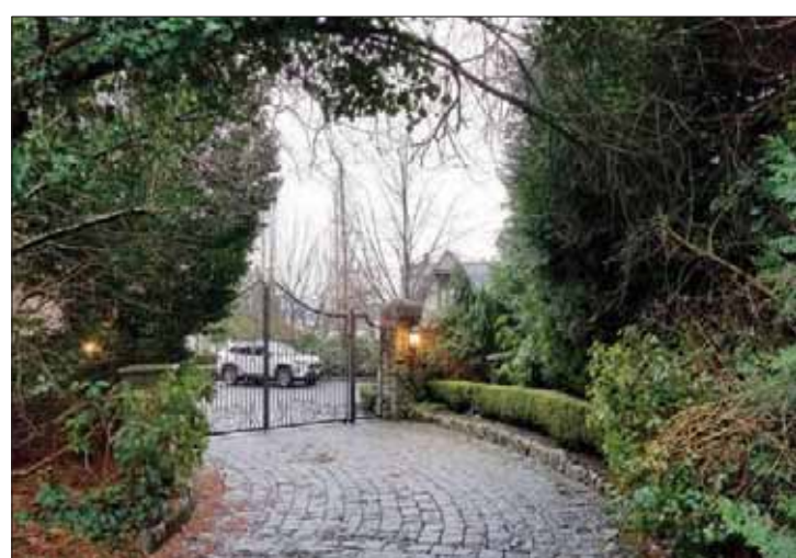
المنزل المؤقت للأمير هاري وزوجته ميغان في فانكوفر بكندا

ونقلت صحيفة «تايمز» عن توماس وودكوك، مسؤول الشعر الملكي الذي وافق جنباً إلى جنب مع الملكة على منح ميغان شعار دوقية ساسكس الملكي، قوله إنه لا ينبغي السماح للزوجين (ميغان ساسكس الملكي) باستخدام اسم عن الالتزام بالواجبات والألقاب الملكية، مضيفاً: «لا أعتقد أنه أمر يبعث على الارتياح. فلا يمكن للمرء أن يكون شيلين في وقت واحد؛ إما أن تكون ملكياً تماماً أو لا تكون على الإطلاق».