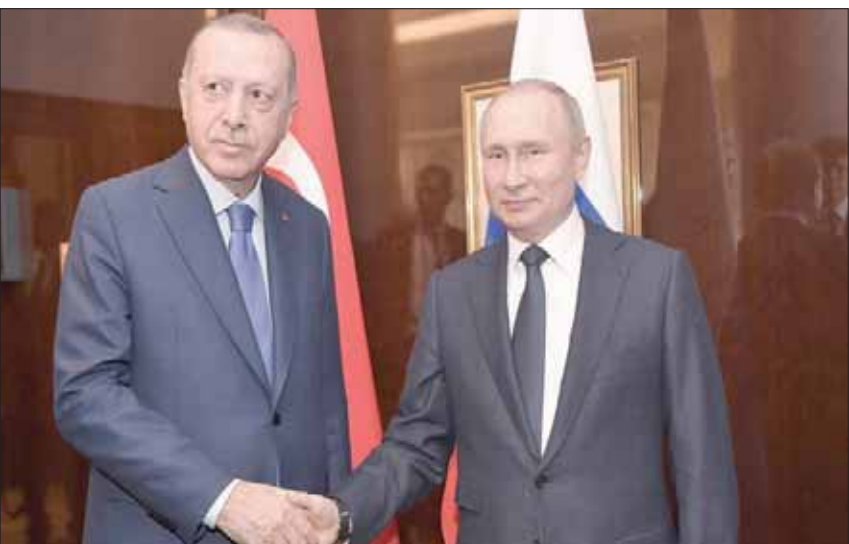
تتهم المعارضة إردوغان بأنه يصغي إلى بوتين أكثر من الأحزاب التركية

يدرس إدخال بعض التعديلات على النظام. ويواجه النظام الرئاسي خطر الإلغاء بسبب الدعوى المقدمة من حزب الشعب الجمهوري إلى المحكمة الدستورية العليا للطعن على نتائج استفتاء تعديل الدستور الذي اجري في 16 أبريل (نيسان) 2017، بسبب قبول اللجنة العليا للانتخابات أصواتاً غير مَحْتومة. وفي الوقت ذاته، تتعالى الأصوات المطالبة بانتخابات مبكرة تجرى في يونيو المقبل، حيث سبكون البرلمان أتم فترة العامين وهي الفترة التي يتعين أن يكملها البرلمان قبل الدعوة إلى انتخابات مبكرة. وطالب رئيس حزب السعادة المعارض نمال كرم الله أوغلو، بمناقشة إجراء الانتخابات المبكرة خلال العام الحالي، قائلاً: «البعض يقول ستكون الانتخابات في