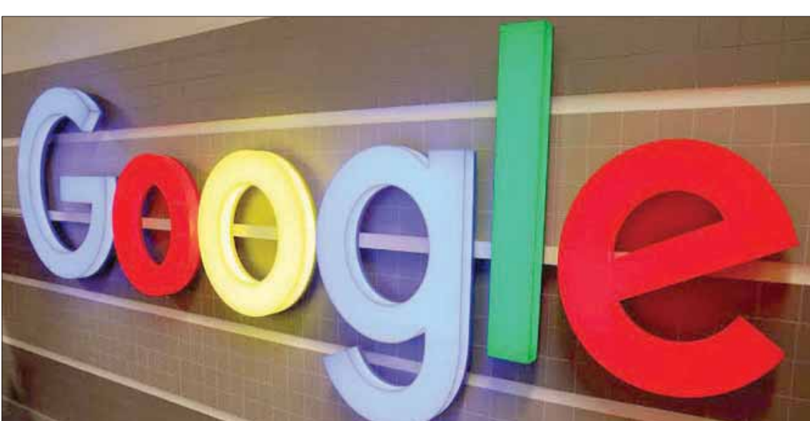
قرار فرنسا كان يقضي بفرض رسم على شركات التكنولوجيا العملاقة يعادل 3 % من حجم أعمالها

وذكرت الرئاسة الفرنسية، الاثنين، أن باريس «تواصل هدفها لفرض رسوم عادلة على مجموعات القطاع الرقمي والتوصل إلى تسوية في إطار منظمة التعاون والتنمية الاقتصادية». وقررت فرنسا أن تفرض رسماً على شركات التكنولوجيا العملاقة بتأجيل 3 في المائة من رقم أعمالها بانتظار تبني قرار على الصعيد الدولي في هذا الشأن. وقبل عام، أحييت الولايات المتحدة مفاوضات حول هذه الضرائب داخل منظمة التعاون والتنمية الاقتصادية التي كانت تعطلها منذ سنوات. لكنها وضعت شروطاً رفضتها فرنسا في ديسمبر (كانون الأول) الماضي. وهددت إدارة الرئيس ترمب بعد ذلك بفرض رسوم إضافية «تصل إلى مائة في المائة» على منتجات فرنسية بقيمة 2,4 مليار دولار.