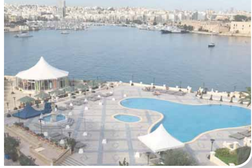
فنادق مالطا تُطل على مناظر خلابة

نحو 6 أضعاف عدد سكان الدولة، ينفقون أكثر من ملياري دولار تقريباً، ويُرجع المسؤولون هذه الزيادة إلى فتح خطوط جوية جديدة مع عدد من دول العالم، وتوضيح أرقام هيئة السياحة في مالطا أن عدد السياح القادمين إليها في زيادة دائمة، يقدر عددهم بـ 5 ملايين سائح، أي