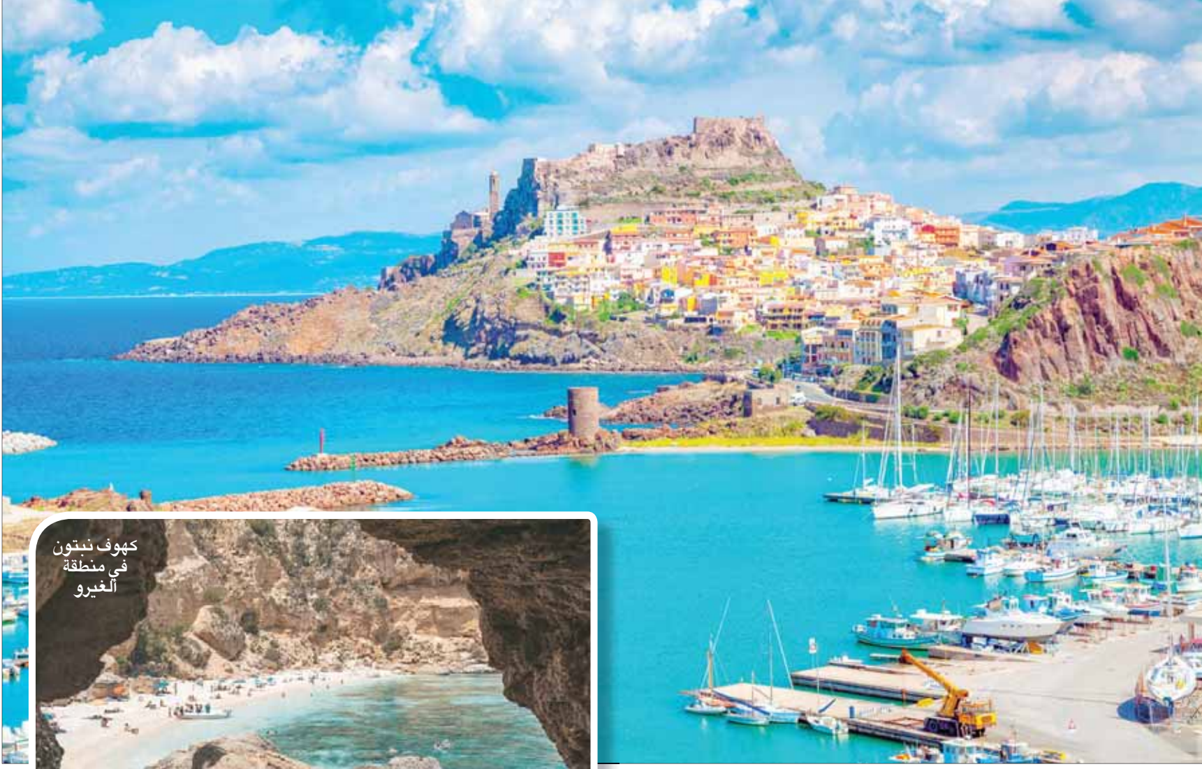
مياه لازوردية ويخوت راسية

أجزاء الجزيرة، إلا أنها عطلة رسمية في سردينيا، حتى في المناطق التي تعتبر أكثر انعزاً، مثل المناطق الداخلية المرتفعة، والسبب أن سكان سردينيا يعززون بفرانهم وتقاليدهم ويريدون أن يورثوها للأجيال القادمة. بدورها تحظى منطقة باربايا الجبلية بمجموعة خاصة من المهرجانات في الفترة بين شهري سبتمبر حتى ديسمبر (كانون الأول) من كل عام؛ حيث تستضيف العديد من العروض الموسيقية والفغاليات، وعرض الحرف المحلية، والمأكولات والمشروبات التقليدية، والمنحجات الثقافية المختلفة كل أسبوع. كما أنها تقدم فرصة تمييزة لشراء المنتجات المحلية.