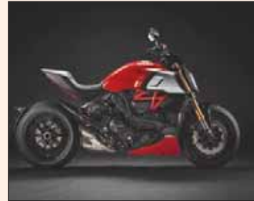
دراجة دوكتاتي الجديدة

تتوقع وكالة «مودي» أن يهبط الطلب الأوروبي على السيارات الجديدة خلال عام 2020 بنسبة تتراوح بين 1 و3 في المائة. وعلت الوكالة توقعاتها بضعف الاقتصادين الإيطالي والإسباني، وتشدد أوروبا في حدود البث الكربوني المسموح بها، وعدم الثقة في المستقبل بسبب «بريكست». وإذا تحقق هذا التراجع، فسوف تعود الأسواق الأوروبية إلى ما كان عليه حجمها في عام 2017.