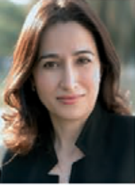
مي يدر: فخورون بالسعوديات