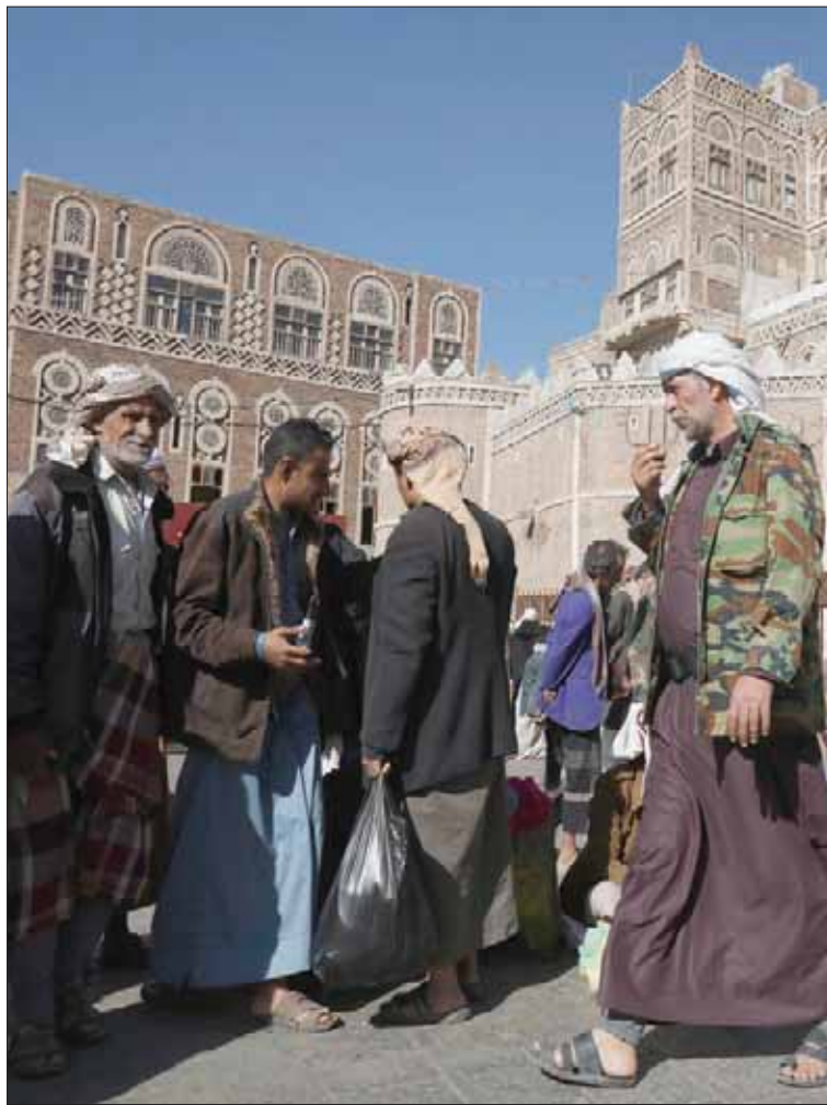
يمنيون عند بوابة «باب اليمن» في المدينة القديمة من صنعاء أول من أمس