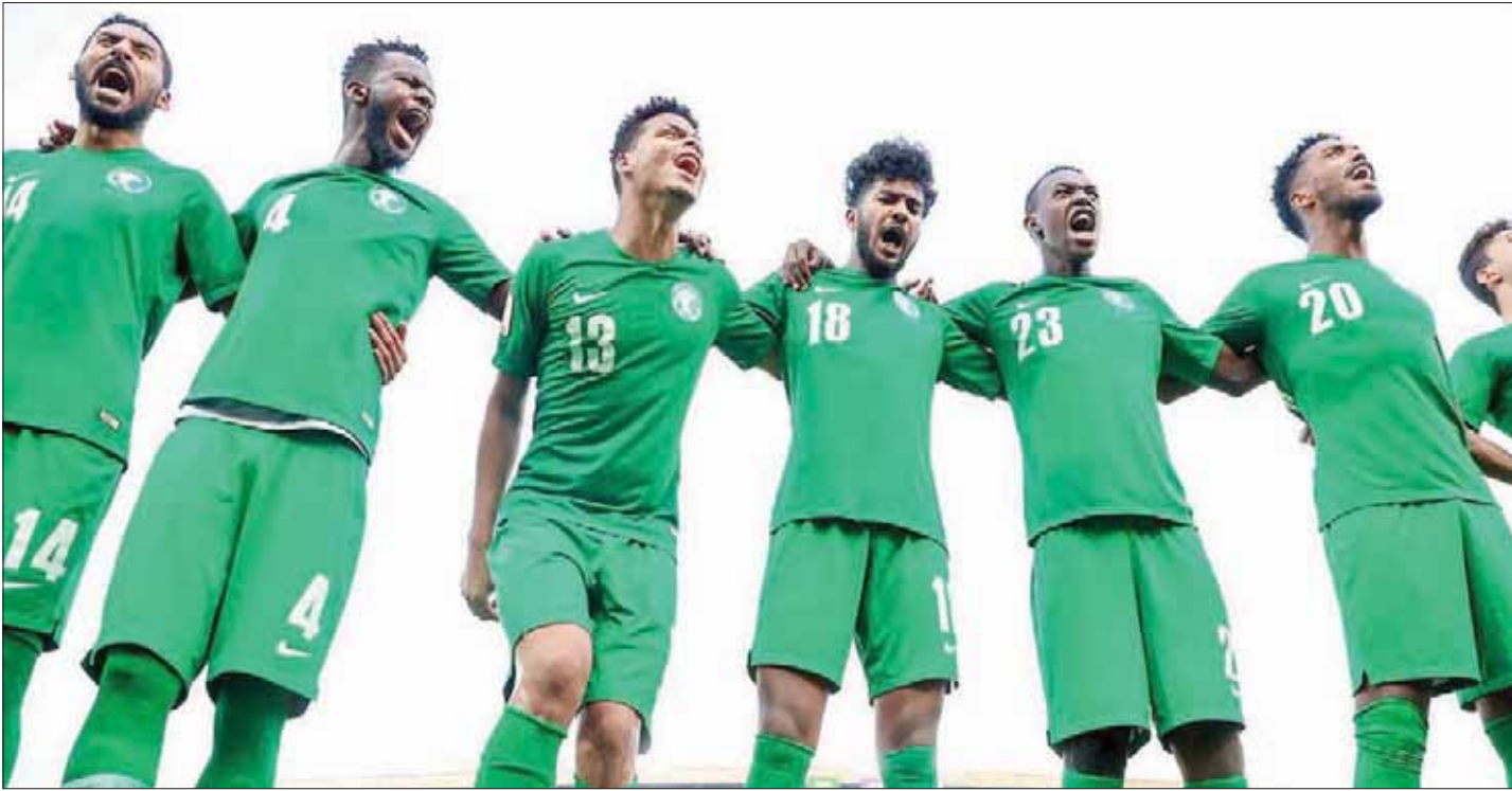
لاعبو المنتخب السعودي الأولمبي أمام مهمة حاسمة اليوم (الشرق الأوسط)

وقال: إن المنتخب السعودي جيد من الناحية الفنية ونعرف طريقة لعبهم، كما لدينا استراتيجيات سنحاول تطبيقها في هذه المباراة، وأملك لاعبين يمتلكون قدرات عالية.