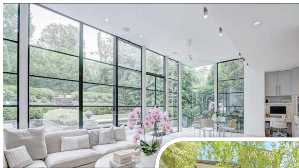
حركة الاستثمار العقاري في الولايات المتحدة استجابت لاستعداد المشترين الراغبين في شراء المنازل الراقية

وحسب بيانات وزارة التجارة الأميركية فقد ارتفع عدد مشروعات المساكن ذات الوحدة الواحدة بنسبة 11,2 في المائة ليصل إلى أعلى مستوى له منذ منتصف 2007، في حين تراجع تراخيص بناء هذا النوع من المشروعات بنسبة 0,5 في المائة خلال الشهر الماضي. وارتفع عدد مشروعات المساكن متعددة الوحدات الجديدة خلال الشهر الماضي بنسبة 29,8 في المائة يصل إلى أعلى مستوى له منذ 1986.