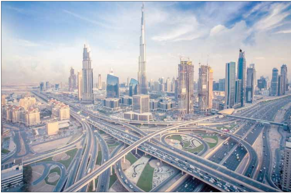
تقرير لشركة «تشيسترنتس» العقارية يشير إلى أن سوق العقارات في دبي تستعيد عافيتها نتيجة التباطؤ الملحوظ في انخفاض أسعار الشقق السكنية (الشرق الأوسط)