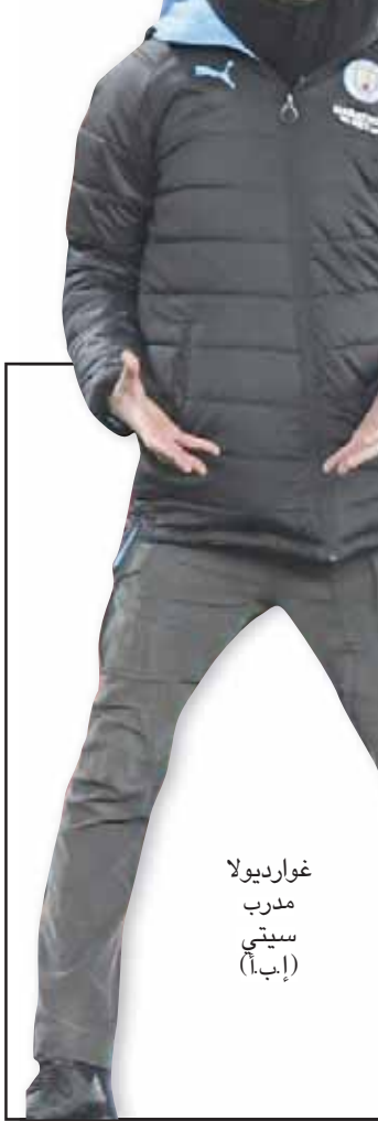
غوارديولا مدرب سيتي

الوقت غير مناسب لكي يفتح غاري هذا النقاش». غير أن سولسكاير لمح إلى إمكانية ضم لاعبين لفترة قصيرة، بعد النكسة التي تعرض لها الفريق بإصابة مهاجمه ماركوس راشفورد، والتي ستبعده ما لا يقل عن 6 أسابيع عن الملاعب. وتعرض المهاجم الدولي الإنجليزي لإصابة بعد دخوله بديلاً في مباراة الإعادة من الدور الثالث لكأس إنجلترا ضد وولفرهامبتون منتصف الأسبوع الماضي، وغاب عن مواجهة ليفربول. وقال سولسكاير: «إصابة راشفورد سيئة، إنه شعر في أسفل ظهره، سيغيب لنحو 6 أسابيع، ومن ثم سيبدأ مرحلة إعادة التأهيل. لقد عانيتنا من الإصابات للاعبين مهمين هذا الموسم»، في إشارة إلى الفرنسي بول بوغبا والاسكتلندي سكوت ماكومينا، متابعا: «هناك لاعبون نرغب في ضمهم على المدى الطويل، ولن نتغير أسماؤهم، فقط لأن لدينا لاعبين مصابين للشهرين أو الثلاثة أشهر المقبلة. وقد توقع مع لاعبين لفترة قصيرة». ومن جهته، أكد راشفورد الذي سجل 22 هدفاً للشياطين الحمر في جميع المسابقات هذا الموسم، منها 14 في الدوري، أنه سيعود أقوى من قبل. وغرد ابن الـ22 عاماً، عبر حسابه الخاص على «تويتر»: «بلمح البصر 2013، رغم إصفاق نحو 850 مليون جنيه إسترليني (1,1 مليار دولار) على ضم لاعبين جدد. وقال سولسكاير إن مناقشة سياسة ضم اللاعبين أمر غير محبذ الآن قبل استضافة بيرنلي. وتابع المدرب البرنليجي: «بالمناسبة لي، فإن الوقت غير مناسب للحديث عن عملية ضم اللاعبين. نتطلع فقط لمبارتنا المقبلة أمام بيرنلي. نسعى دائماً لتحسين تشكيلتنا وتعزيز قوة النادي، لكن من وجهة نظري، فإن