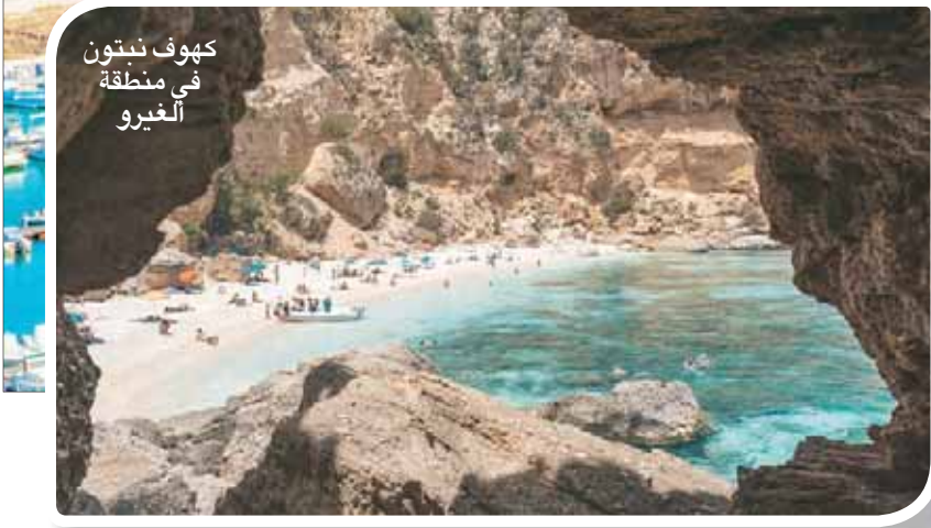
كهوف نبتون في منطقة الغيرو