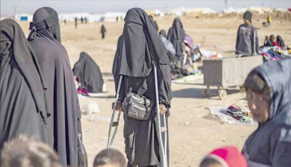
مخيم الهول في شمال شرقي سوريا يؤوي آلاف الأطفال والنساء، من عائلات الأجنبي الذين قاتلوا في صفوف «داعش»

وفي القسم المخصص لـ«المهاجرات»، وهي التسمية التي تطلق على الأجنيات من زوجات مقاتلي التنظيم، تمتنع نسوة كثيرات عن التحدث إلى وسائل الإعلام، إذ تسعى بعض النساء إلى منهن، متحججات بتطبيق قواعد تنظيم داعش بعدم التحدث إلى الصحافيين. باقتضاب، تجيب «امل» التي تستخدم اسماً مستعاراً على أسئلة الصحافاة الفرنسية» وتقول: «قمنا بمغامرة... نريد العودة فقط. لا أريد البقاء في هذا المخيم، هذا كل ما في الأمر؛ أرغب في أن أعيش حياة طبيعية». وأعلنت فرنسا، تحت ضغط من الراي العام، أنها ستكفي على الأرجح بإعادة الأطفال البتامي من أبناء المسلمين الفرنسيين، ولم تقبل حتى الآن باستعادة الأطفال الفرنسيين إلا بعد درس «كل حالة على حدة». وفي يونيو (حزيران)، استعدت فرنسا 12 طفلاً، معظمهم يتامى. وتقدر فرنسا وجود نحو 450 فرنسياً محتجزين أو يقعون في مخيمات النزوح لدى الأكراد في سوريا. ومنذ إعلانهم القضاء على «خلافه» التنظيم المتطرف في مارس (آذار)، يطالب الأكراد الدول