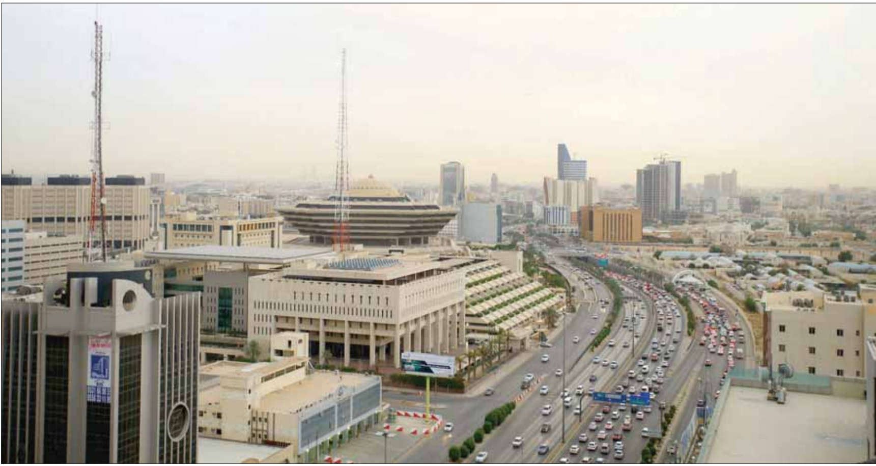
شهد القطاع العقاري العام الماضي زيادة ضخمة في السيولة المدارة نتيجة لضخ برنامج «سكني» ضمن برامجه كثيراً من القروض العقارية الممنوحة للأفراد

وتشهد القطاع العقاري العام الماضي زيادة ضخمة في السيولة المدارة نتيجة لضخ برنامج «سكني» ضمن برامج كثر من القروض العقارية الممنوحة للأفراد، وهو ما دفع كثيراً من القروض العقارية به للتطبيق ارتفاعاً بنحو 39 في المائة مطلع العام الماضي ووصل مع نهاية العام إلى أعلى من 81 في المائة.