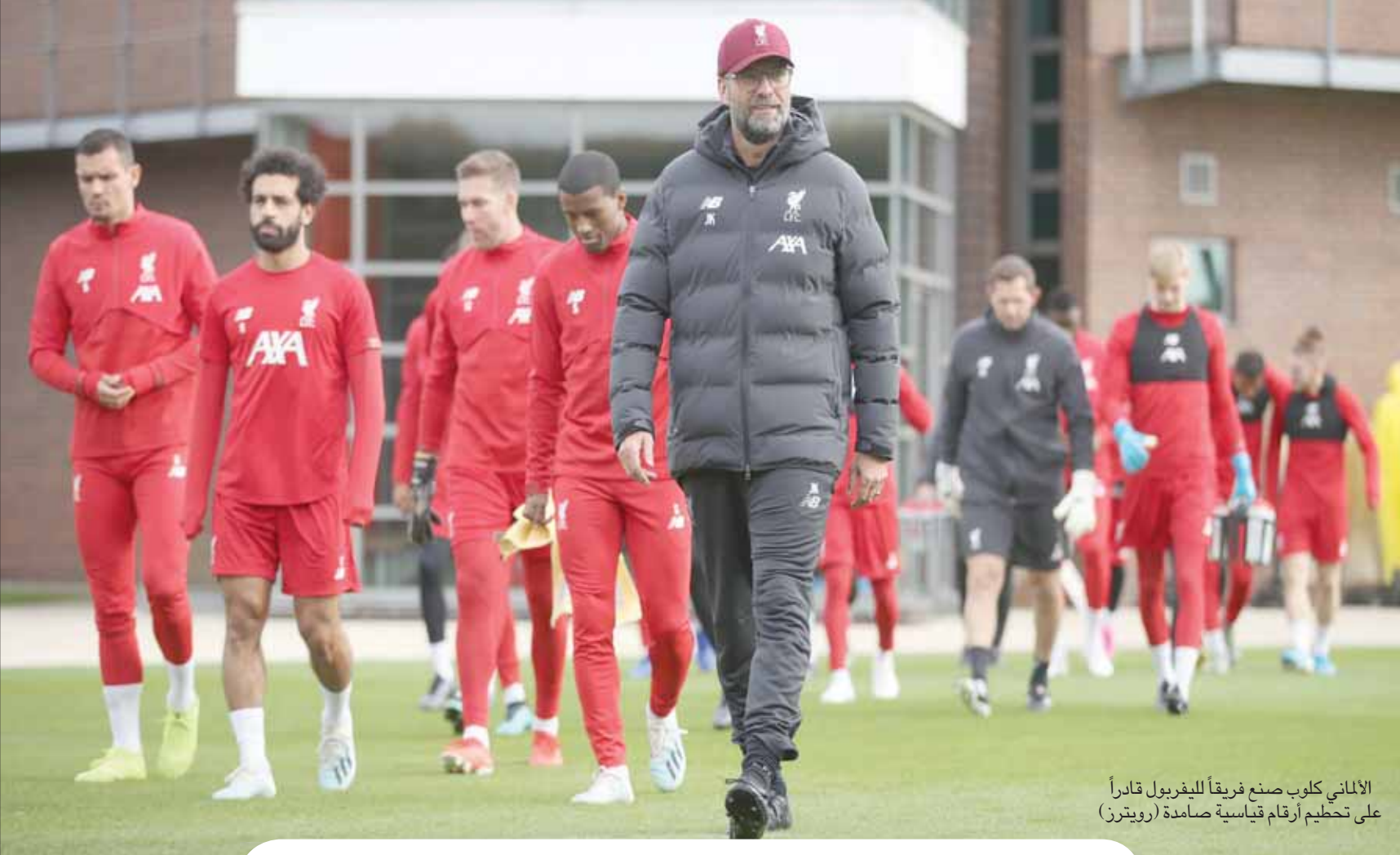
على تحطيم أرقام قياسية صامدة الألماني كلوب صنع فريقاً للليفربول قادراً

وتحت ليفربول نفسه، لا سيما على ملعب أنفيلد، كفريق يحلق خارج المنافسة محلياً هذا الموسم، إذ تعود خسارته الأخيرة في الدوري الممتاز إلى الثالث من يناير 2019 أمام مانتشستر سيتي (1 - 2)، ومنذ تلك المباراة، لم يعرف ليفربول طعم الخسارة.