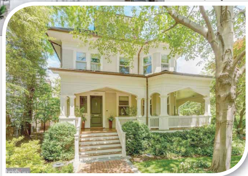
استعدادت سوق البناء زخمها بعد خفض الفيدرالي الأميركي معدلات الفائدة ثلاث مرات في العام الماضي