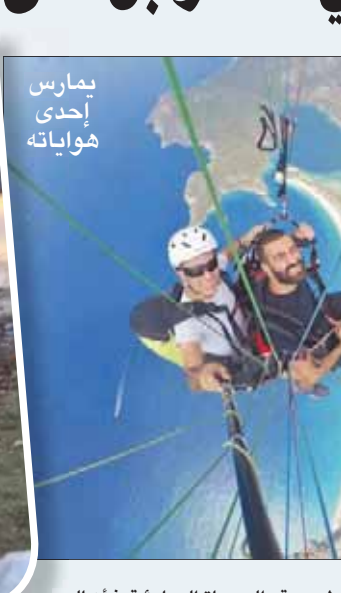
يمارس إحدى هواياته