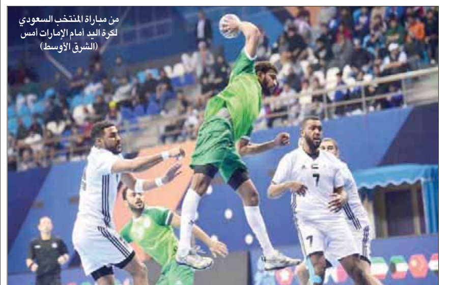
الدمام: علي القطان

من مباراة المنتخب السعودي لكرة اليد أمام الإمارات أمس (الشرق الأوسط)