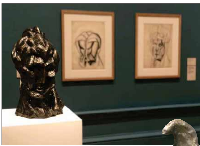
منحوتة رأس امرأة وخلفها رسومات مكملة

نرى شريطاً مصوراً للمعرض المتميز من الناحية البصرية والموسيقية.