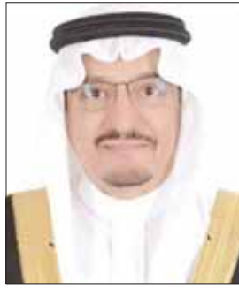
الدكتور حمد آل الشيخ وزير التعليم السعودي

أكد أن عملية الإصلاح داخل الوزارة ستطال الهياكل والأنظمة الإدارية والمناهج