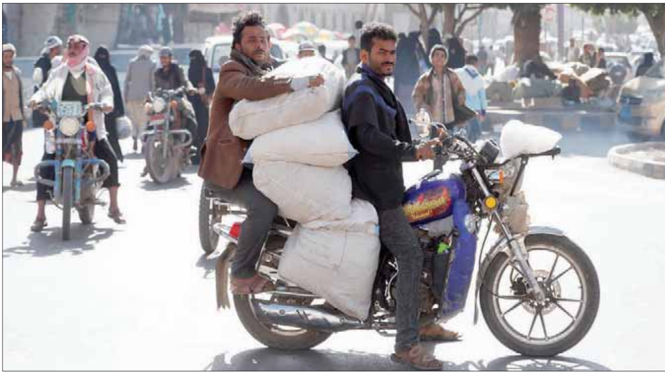
مواطنون في العاصمة اليمنية صنعاء أول من أمس

ميليشيات الحوثي المدعومة إيرانياً والذي راح ضحيته أكثر من 100 قتيل وعشرات الجرحى، مجدداً إرثه لهذا الاستهداف الذي وصفه بـ «الغادر». وقال الحضرمي إن وزارة الخارجية خاطبت الأمين العام للأمم المتحدة ورئيس مجلس الأمن وطالبت بإدانة الهجوم الحوثي الصارخي، مؤكداً أن «استمرار الميليشيات في فرض القيود في مجال العمل الإنساني والتدخل في توزيع المساعدات الإنسانية ومنع وصولها لمستحقيها، وفرض ضرائب وإتاوات غير أخلاقية وغير قانونية على المشاريع والمساعدات الإنسانية وغيرها من الانتهاكات تستدعي وقف جادة من مجلس الأمن واتخاذ خطوات وإجراءات عقابية رادعة كفيلة بإنهائها».