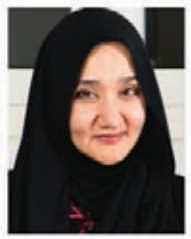
د. سفير القرشي: كوامن الفكر والعقل