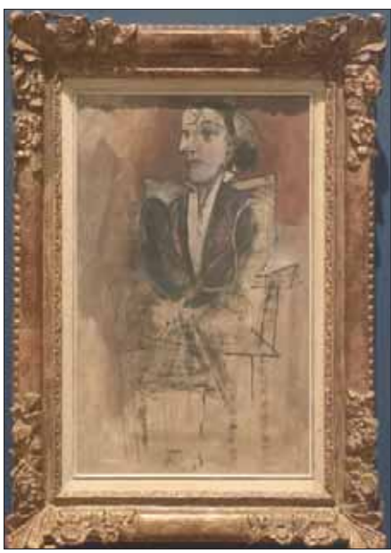
لوحة «دورا مار جالسة» 1938

نرى عدد الرسومات التي نفذها الفنان في دراسات مستقلة يستكشف من خلالها عناصر عمله، منها لوحة «البحار» ورسومات لنساء في وضعيات وأقفة نذكرنا بالفن الأفريقي، وربما قليلاً الفن الفرعوني