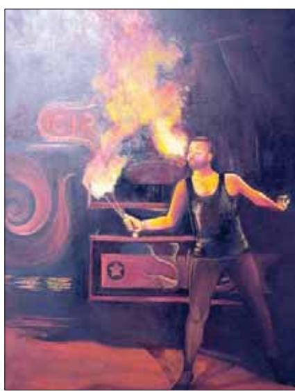
من ألعاب السيرك التي تصورها واحدة من لوحات المعرض

وتبهرن اللوحات عنصر الحركة بشكل لافت، باعتباره عنصراً محورياً في موضوع السيرك، سواء في ديناميكية التفاعل بين فقراته، أو الألعاب التي تعتمد على الخفة، وأحياناً الخطورة؛ كعنصر أساسي للإيهام والتواصل مع الجمهور، وكذلك التقليل المدرس للحيوانات المصاحبة لفقرات السيرك كالخيول مثلاً التي أفردت لها العديد من لوحات العرض تشریحاً لحركاتها الجسدية الراقصة، سواء منفردة، أو ضمن مجموعات تقدم عرضاً في حركة دائرية مُتناغمة بمصاحبة مُدرتها.