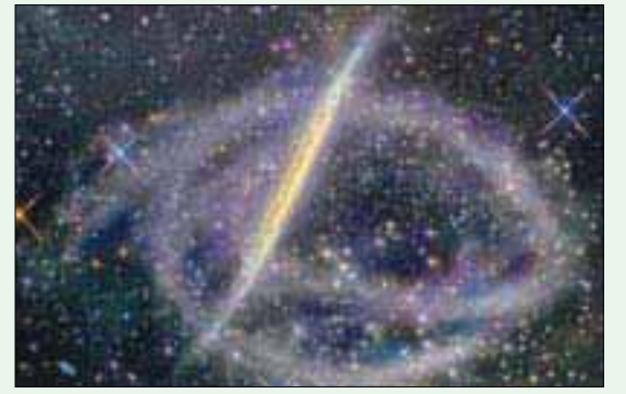
مجرات درب اللبانة

لوس أنجلوس - لندن: «الشرق الأوسط» بصمة نادرة حقاً، وأضاف: «كنا قد رأينا ذلك سابقاً، ولكن الأمر لم يبدو غريباً للغاية، إلى أن اقترب من الثقب الأسود وتمدد». وأشارت جيز إلى أن هذا الجرم يفقد خلال ذلك جزءاً كبيراً من غازه... عندها يتحول من جرم غير لافت كثيراً، طالما ظل بعيداً عن الثقب الأسود، إلى جرم اقترابه الكبير». وعثر فريق جيز الآن على أربعة أجرام أخرى من هذه الأجرام في وسط الثقب الأسود هائل الحجم الموجود في مركز درب اللبانة، وهي الأجرام التي أعطوها الأرقام G3 حتى G6. «وأصبح لدينا الآن تجمع من الأجرام G، يقول أوضحت الباحثة إلى ستة، كما يتحدث فريق الباحثين عن طبقة خاصة من الأجرام الغريبة، وأشاروا إلى أن الطبيعة المحددة لهذه الأجرام غير واضحة، حسب وكالة الأنباء الألمانية. وكانت مجموعة من الباحثين تحت إشراف جيز، قد عثرت عام 2005 على أول جرم من هذا النوع من الأجرام، واطلقوا عليه اسم G1. وهو يدور في فلك مركز غلاف الغاز، فإنه لم يفقد غلاف الغاز، ولا يقترب منه جداً، وفي وقت لاحق، وفي عام 2012، عثر باحثون تحت إشراف شتيغان جيلسمان من معهد «ماكس بلانك» الألماني لفيزياء الأجرام غير الأرضية، بمدينة جارشنينغ، بالقرب من مدينة ميونخ، على جرم آخر واطلقوا عليه اسم G2، والذي سر عام 2014 قريباً من مركز الثقب الأسود. وأكدت جيز أنه «في وقت الاقتراب التالي ترك