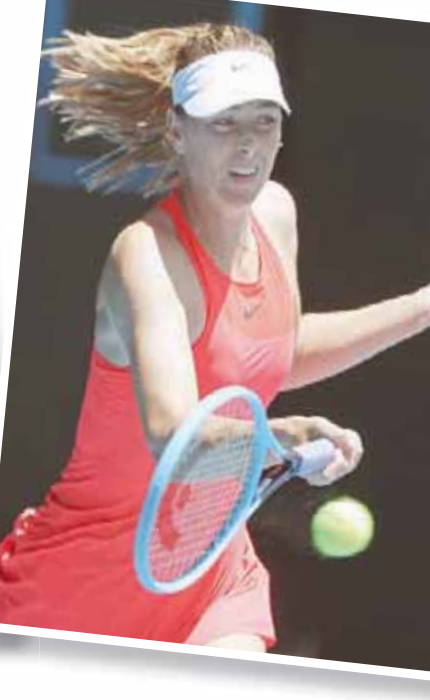
شارابوفا وخسرت تلقي بظلالها على مستقبلها بالعبلة

في هذه بداية إيجابية، ما يريده المرء هو الفوز في الدور الأول، والأفضل إذا تحقق ذلك بثلاث مجموعات متتالية، هذا اللاعب (رود لايفر أرينا) يمنحني الكثير من الطاقة الإيجابية». وعن منافسه ديليين، قال نادال: «عاني في الأشواط الخمسة الأولى لكنه حصل على فرص للفوز ببضعة أشواط. إنه مقاتل وشخص رائع». ويلقي الإسباني البالغ 33 عاماً في الدور الثاني الفائز من مباراة الأرجنتيني فيديريكو ديليبونيس والبرتغالي جواو سوزا. وخلافا لنادال، عانى الروسي دانييل مدفيديف الرابع لحجز بطاقته واحتاج صاحب الأربعة القاب في 2019 بينما بطلة الماسترز الختامية، إلى ساعتين و 36 دقيقة لتخطي عقبة الأميركي فرنسيس تيناو بأربع مجموعات 6 - 4 و 3 - 6 و 6 - 4 و 2 - 6 واحتاج تيم، المصنف خامسا ووصيف بطل رولان غاروس للموسم الماضي، إلى ساعتين و 44 دقيقة للفوز على الفرنسي أدريان مانارينو 6 - 3 و 7 - 6 و 5 - 2 والتأهل حيث يلتقي في الدور الثاني، وتأهل أيضا الإسباني روبرتو باوتستيا - أغوت التاسع والكرواتي مارين سيليتش، بطل فلاشينغ ميدوز لعام 2014 ووصيف أستراليا الرابعة. وعند السيدات، احتاجت التشيكية كارولينا بليشكوكا، المصنفة الثانية ووصيفة بطلة