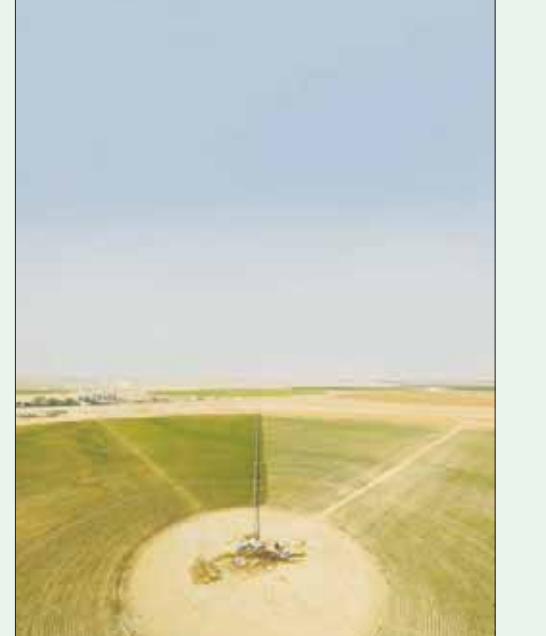
تظهر الصورة نظام ري نموذجياً يغمر حقلاً بمساحة 50 هكتاراً