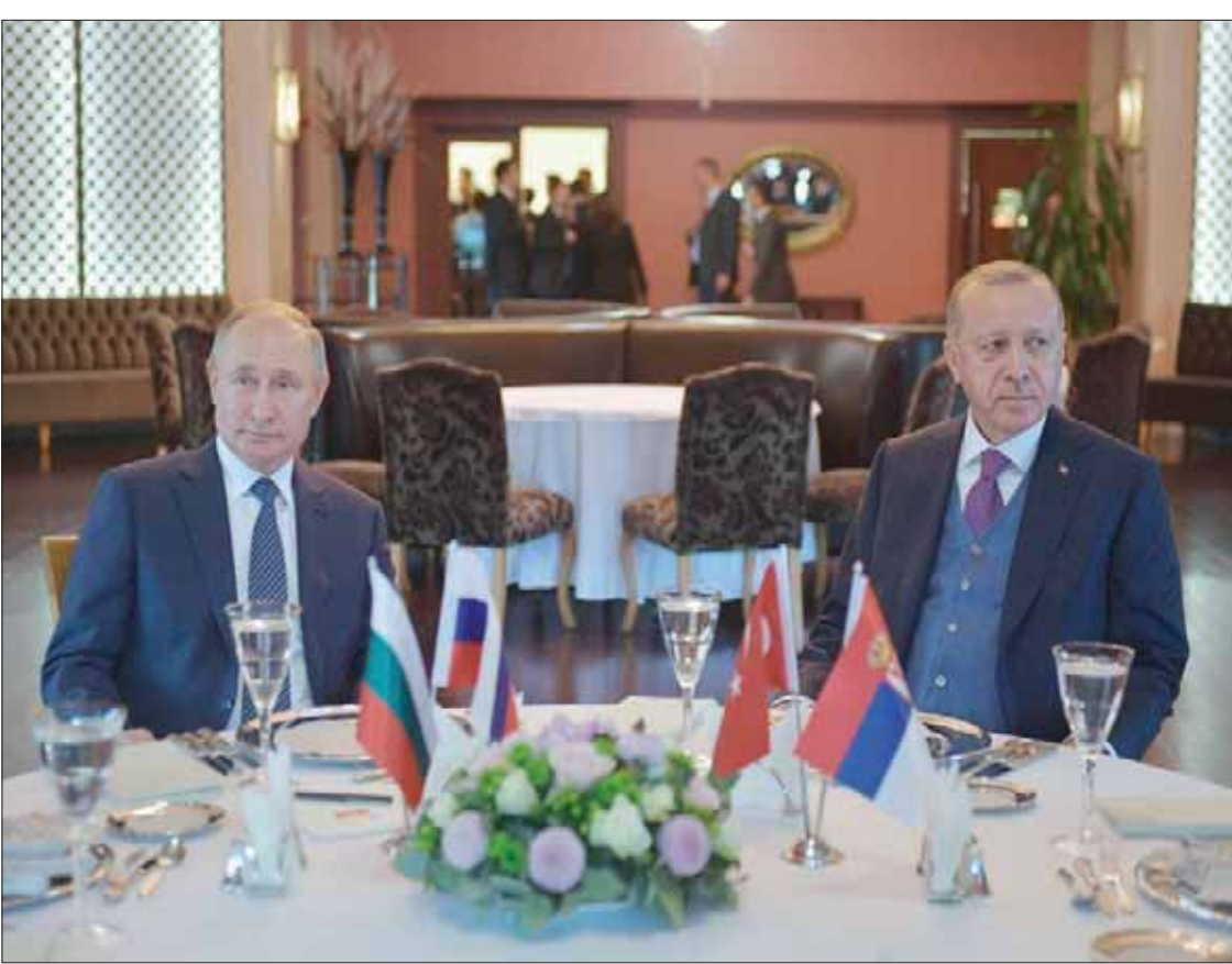
الرئيسان الروسي فلاديمير بوتين والتركي رجب طيب إردوغان خلال لقائهما في إسطنبول أمس

وقال بوري بارمين، مدير دائرة الشرق الأوسط وشمال أفريقيا في مجموعة «موسكو بوليسي» للأبحاث، إن «مطلب روسيا بسيطة جداً. على تركيا بذل مزيد من الجهود للقضاء على الخلايا الإرهابية في إدلب. سنتناول النقاشات هذه الفكرة».