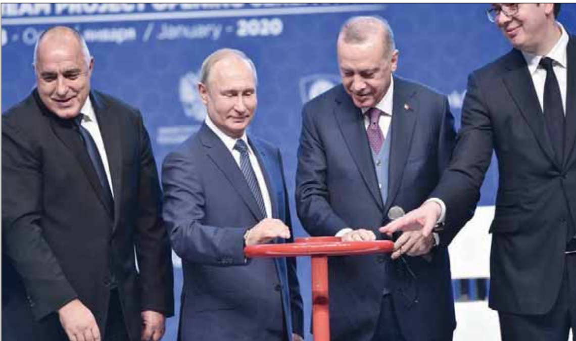
لم يكن حجم العلاقات التجارية خلال العام الماضي بين روسيا وتركيا بقدر تطلعات رئيسي البلدين

دخلت مرحلة جمود على خلفية التوتر السياسي بينهما، بعد أن أسقطت مقادثات تركية قازفة روسية في سوريا في 24 نوفمبر (تشرين الثاني) عام 2015، حينها وردا على تلك الحادثة جمدت روسيا جميع علاقاتها التجارية مع تركيا وحظرت استيراد جميع المنتجات التركية عملياً. واستمر الوضع على حاله هذه حتى يونيو (حزيران) 2016، حين بدأ تطبيع العلاقات الثنائية مجدداً، بعد أن أرسل الرئيس التركي رسالة إلى الرئيس الروسي، اعترز فيها عن إسقاط القاذفة الروسية.