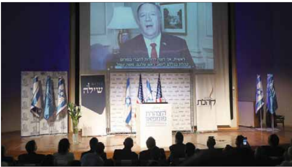
وزير الخارجية الأميركي مايك بومبيو يتحدث عبر فيديو إلى مؤتمر المستوطنات الإسرائيلية أمس