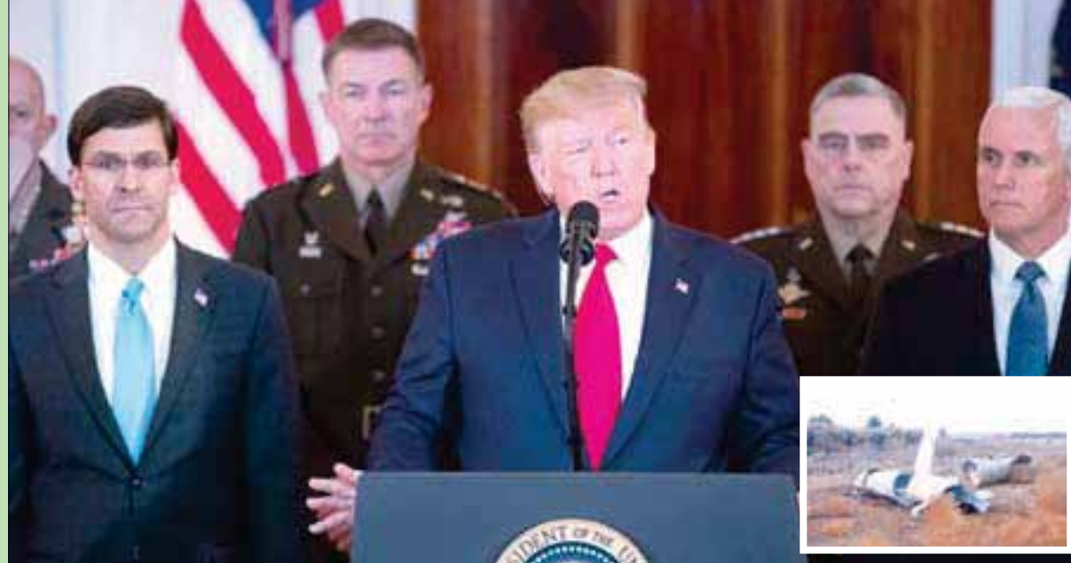
ترمب يتحدث خلال مؤتمر صحفي في البيت الأبيض أمس وفي الإطار قباليا للصواريخ التي أطلقتها إيران على قاعدة «عين الأسد» في الأنبار أمس