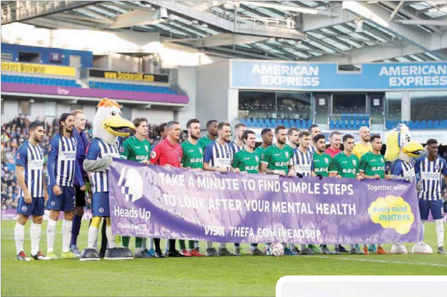
لاعب برايتون وشيفيلد ونزادي يحملون لافتة تشجع على التفكير في الصحة الذهنية

من ناحيته، كتب لاعب خط وسط أرسنال والمنتخب الإنجليزي السابق الذي تحول للعمل في التعليق الرياضي، بول ميرسون في إحدى الصحف بالتزامن مع انطلاق مبادرة تعزيز الوعي بالصحة الذهنية خلال عطلة نهاية الأسبوع: «في مثل هذا الوقت من العام الماضي، راودتني الرغبة في الانتحار. وأنا اليوم أعترف بذلك على أن يساعد قولي هذا شخصاً ما. ولو أن شخصاً واحداً فقط قرأ ما كتبتة ووجد فيه عوناً له، إذن سأشعر بهذا الخلال كان مفيداً حقاً». ودعونا جميعاً نتذكر دوماً أنه لا بأس في أن تكون معتل الحال بعض الأحيان.