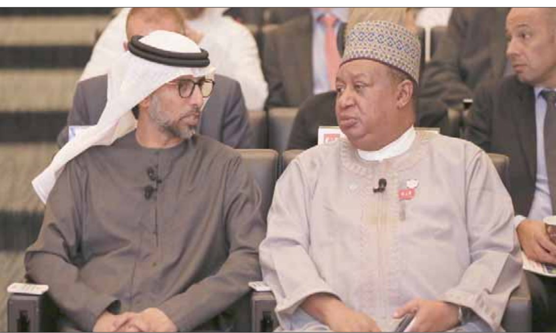
وزير الطاقة الإماراتي سهيل المزروعى وأمين عام أوبك محمد باركيندو في أبوظبي أمس

وأضاف زنگنه «أسعار النفط تتجه للصعود وهذا يفيد إيران... ينبغي أن يتمتع الأميركيون عن زعامة المنطقة وأن يدعو شعوب المنطقة لتعيش».