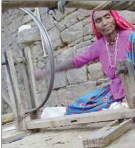
عاملة تغزل قطن الكالا

ضُيغت باللون النيلي الخالص، ولا تزال ضمن أولى مجموعات مشرعها الكبير، وشهادة وثيقة تؤكد على التزامها بكل ما هو طبيعي في أعمالها. تقول المصممة إنها «لاحظت أن نحو 20 من أصل 25 لتراً من المياه تُهدر لكل بنطلون من الجينز منذ بداية العملية وحتى وصولها إلى الرفوف»، لهذا اختارت الاستعانة بالقطن العضوي، وبالأصباغ النباتية الطبيعية، والتخلص تماماً من الغسيل الحمضي. والغسيل اليدوي، يجذب «دنيم غرين» أصحاب الأذواق الكلاسيكية، وهو يخرج من غسيل شجرة الشاي ذات الرائحة العطرية، مع الغسيل المضاد للبكتيريا، كما أنه يُباع بالأزوار الغضبية البراقة النقية. بدوره قال المصمم الهندي «راجيش براتاب سينغ»، إن الأمر ليس مجرد تقديم منتج جديد من منتجات الموضة هندي على المصمم أن يحترمه بمنحه الاستثمارية من خلال تصاميم كلاسيكية تبدو رائعة اليوم في العاصمة دلهي، وبعد مرور 10 سنوات من الآن مناسبة في مدينة نيويورك وغيرها من العواصم. المصمم «شاني هيمانشو»، الذي كان يعمل مستشاراً لبيوت أزياء راقية معنية بصناعة منتجات الجينز مثل «ديزل»، كانت خيراته هي الأساس لإطلاق مجموعته الخاصة من الجينز المنسوج يدوياً. بداية دخل المجال بالتعاون مع