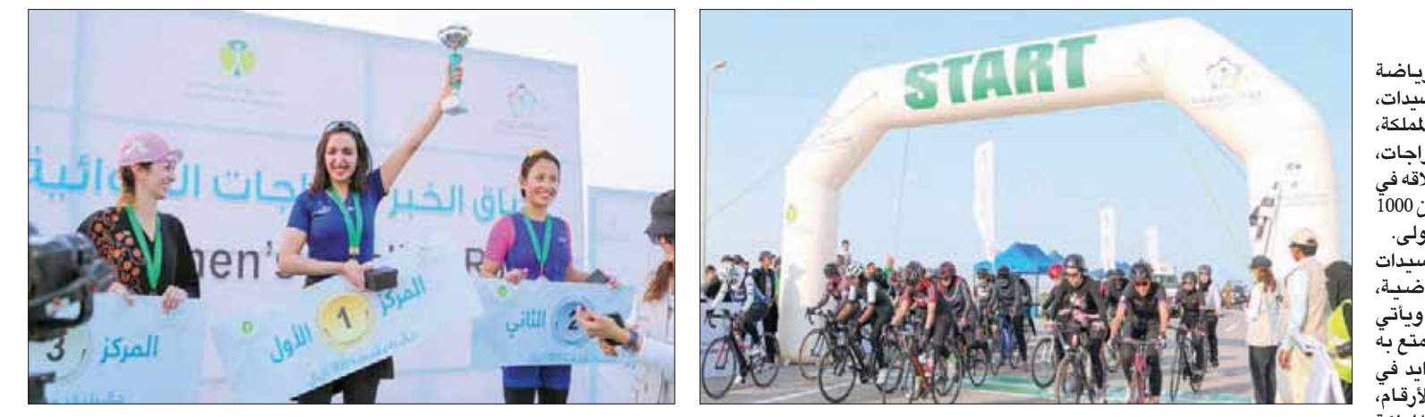
سباقات الدراجات الهوائية للسيدات شهدت مشاركة واسعة

وتأتي هذه الفعالية في سياق أهداف «رؤية المملكة 2030» التي تتطلع قدماً إلى رفع معدلات اللياقة البدنية بين أفراد المجتمع، وذلك من خلال زيادة مستويات الأنشطة البدنية والرياضية في المجتمع لتصل إلى 40 في المائة، مما يؤدي ذلك إلى تعزيز الأنماط الصحية، وهو الأمر الذي برهنته الكثير من الدراسات في هذا الجانب.