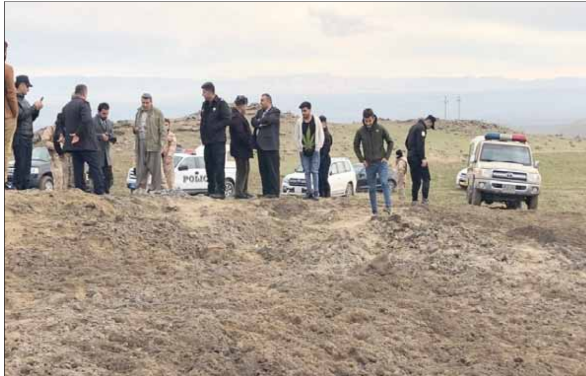
موقع سقوط أحد الصواريخ التي أطلقتها إيران في أرض خلاء قرب أربيل

وركزت غالبية التعليقات أمس على الدور «الضعيف» الذي يمارسه رئيس حكومة تصريف الأعمال المستقل عادل عبد المهدي حيال الضربات المتبادلة بين واشنطن وطهران، وعذ بعض المعلقين إن دور عبد