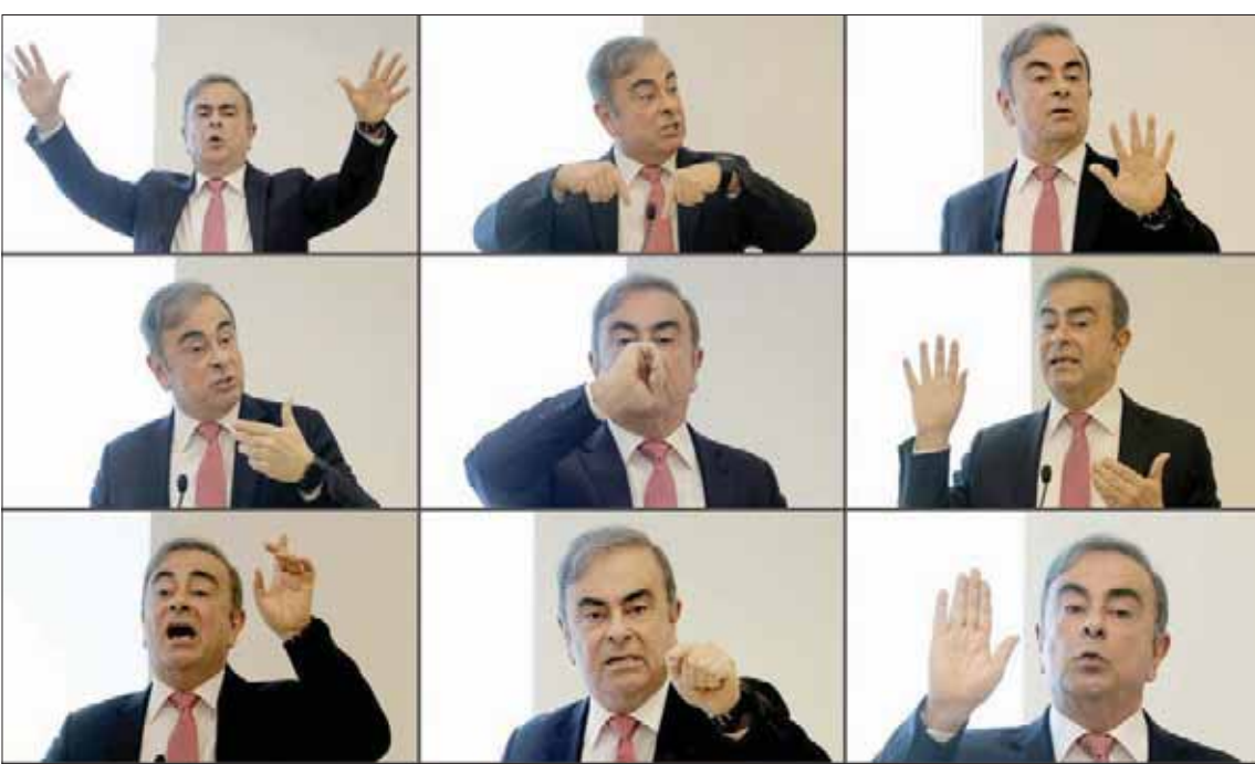
عصن خلال مؤتمر الصحفي في بيروت أمس

بيروت، الشرق الأوسط» جدد رئيس الجمهورية ميشال عون التأكيد على التزام لبنان تطبيق القرار (1701) الصادر عن مجلس الأمن، وأن العمل قائم لتحسين الوضع السياسي، عبر الإسراع في تأليف الحكومة والحفاظ على الأمن في الداخل، وعلى طول الحدود. جاء كلام عون خلال استقباله، أمس، وكيل الأمين العام للأمم المتحدة للسلامة والأمن جيل ميشو، والمخمس العام للأمم المتحدة لدى لبنان، يان كوبيتش، والوفد المرافق، حيث أكد «الحرص على تعزيز التعاون القائم بين