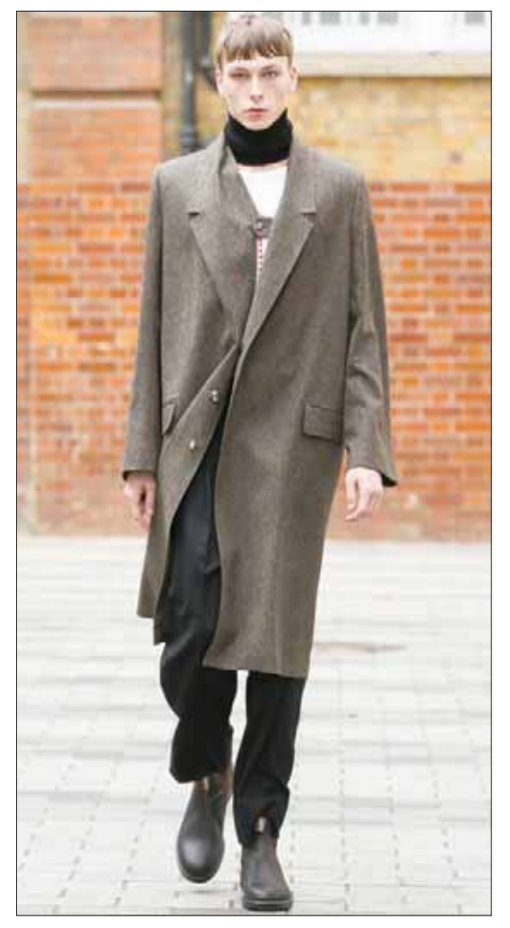
من عرض «تشالايان»

ما يمكن أن نتعلمه من أسبوع لندن لإخريف وشتاء 2020، في دورته الـ15، أن الموضة أحوال. بمعنى أنها يمكن أن تتغير في رمشة عين. والمقصود هنا ليس سرعة أو تقليعة جديدة تنتشر انتشار النار في الهشيم من دون سابق مقدمات أو من دون أن تكون لها مؤهلات لذلك، بل قطاع الأزياء الرجالية ككل. فبعد أن انتعش في بداية العقد وتوقع الكثيرون أنه سينمو أكثر من قطاع الأزياء النسائية في حال استمر الإقبال على الوتيرة نفسها، تراجع في العام الماضي بشكل لا يمكن إنكاره. فأسابيع الموضة التي انطلقت في الكثير من العواصم العالمية لتخاطب الجنس الخشن بتصاميم واللوان ناعمة، تقلصت، وتم دمج أغلبها مع عروض الأزياء النسائية حفاظاً على ماء الوجه من جهة، وتقليصاً للتكاليف من جهة ثانية. لكن وحسب التقارير المنشورة مؤخراً، فإن عروض الأزياء الرجالية بدأت تسترجع قوتها. أسبوع لندن الرجالي، مثلاً، عقد شراكة مع أسبوع ميلانو سيعرض فيها بعض مصمميها في عاصمة الموضة الإيطالية. كما أن «براد» التي غابت في الموسم الماضي مفضلة التوجه إلى شانغهاي، قررت العودة هذا الموسم إلى أراضيها، بينما دمجت كل من «غوتشي» و«سالفاتوري فيراغامو»