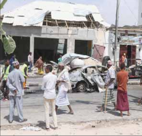
موقع انفجار سيارة قرب البرلمان في مقديشو أمس