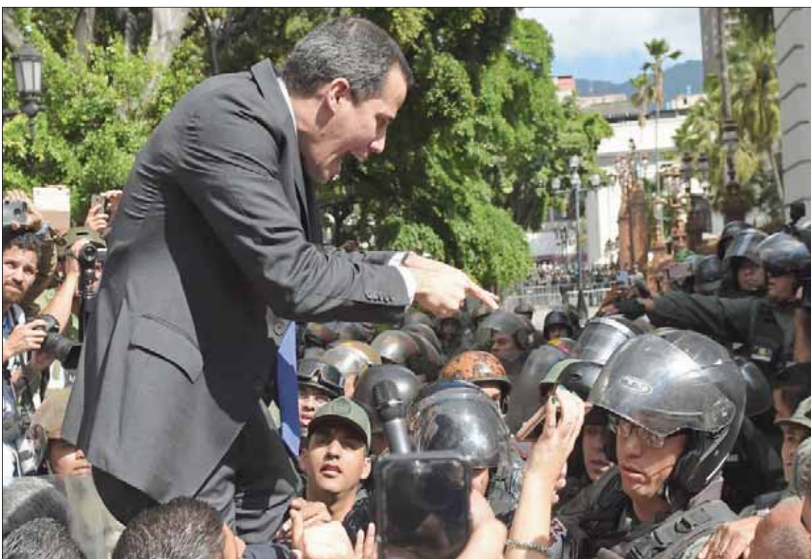
غوايدو يتشاجن مع قوات الحرس المدني محمولاً على اكتاف نواب المعارضة أمام البرلمان أول من أمس

المساعدة على زيادة عزل النظام الفنزويلي كما استنجدت واشنطن، وذلك عندما قرر فرناندينز سحب أوراق اعتماد مندوبة غوايدو في الأرجنتين المحامية اليسا فروتا، التي كان الرئيس الأرجنتيني السابق ماوريسيو ماسري، قد اعترف بها بوصفها الممثلة الدبلوماسية الشرعية لحكومة فنزويلا في الأرجنتين. وقالت فروتا، وهي محامية متخصصة في حقوق الإنسان، إنها تسلمت كتاباً من الخارجية الأرجنتينية تبلغها فيه قرار إنهاء مهمتها الخاصة، فيما أعلن ناطق بلسان الوزارة أن الحكومة قررت إعادة مبنى البعثة الدبلوماسية الفنزويلية إلى ممثلي نظام الرئيس نيكولاس مادورو. وكانت فروتا قد صرحت في أعقاب الموقف الذي صدر عن وزير الخارجية الأرجنتيني بشأن الأحداث التي وقعت في البرلمان الفنزويلي، معربة عن شكرها لحكومة فرناندينز على موقفها وتضامنها مع نضال الفنزويليين لاستعادة الديمقراطية. وكان رئيس الجمعية التأسيسية الفنزويلية ديوسادو كايوبو، الذي يعد من أركان النظام في فنزويلا، قد انتقد بشدة تصريحات الوزير الأرجنتيني قبل صدور القرار بتجريد مندوبة غوايدو من أوراق اعتمادها.