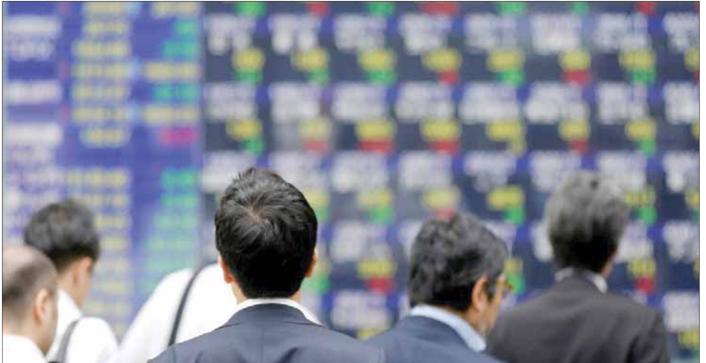
كان شهر ديسمبر الماضي الأفضل على مدار العام بالتدفقات الاستثمارية بالسندات والأسهم في الأسواق الناشئة