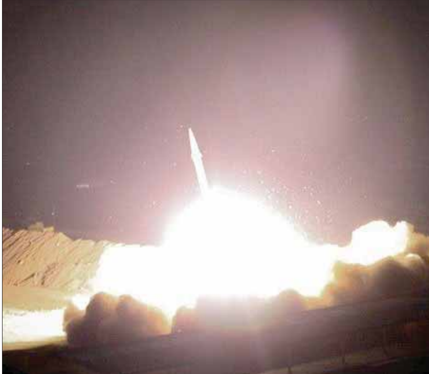
إطلاق صاروخ من قاعدة «الحرس الثوري» قرب مدينة كرمانشاه غرب إيران فجر أمس

أطلق «الحرس الثوري» الإيراني عشرات الصواريخ أرض - أرض الباليستية على قاعدتين لقيوات تقودها الولايات المتحدة في العراق أمس، ردًا على ضربة أميركية العمليات العسكرية والمخابراتية الإيرانية، قاسم سليمانى؛ ما عتق المخاوف من نشوب حرب جديدة في الشرق الأوسط، رغم أنها لم تسجل أي خسائر في القوات الأميركية. وأعلن «الحرس الثوري»، الموازي لـ «الجيش» الإيراني، في بيان رسمي، أمس، أن وحدته الصاروخية، نفذت «الوعد بالثأر الصعب» لمقتل سليمانى بإطلاق عشرات صواريخ على قاعدة عين الأسد، أكبر قاعدة جوية عراقية تستخدمها القوات الأميركية في العراق، وذلك في عملية حملت اسم سليمانى رمزيًا، قبل أن تكمل مراسم دفنه بعد ساعتين على الهجوم.