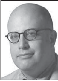
إيلي ليك *

على امتداد 40 عاماً، انتشغل الرؤساء الأميركيون بسؤال جوهري بخصوص إيران، كان أفضل إيجاز له ما طرحه هنري كيسنجر: هل هي دولة أم قضية؟ مساء الخميس، قدم دونالد ترمب له الإجابة: إيران قضية، تحديداً قضية إرهابية، وسيجري التعامل معها على هذا النحو.