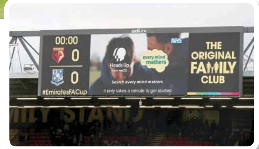
شاشة ملعب نادي وانفورد تطلب من الجميع التفكير دقيقة في صحتهم الذهنية

للدخول في إجراءاته الأخيرة. وباعتبار الاتحاد الأكيان التخطيطي المسؤول عن كرة القدم، فإنه كثيراً ما يتعرض للانتقادات التي غالباً ما