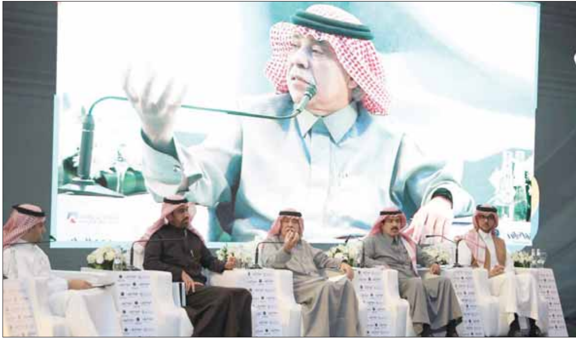
شدد وزير التجارة والاستثمار السعودي الدكتور ماجد القصبي في أكثر من مناسبة على ضرورة التشارك بين القطاعين العام والخاص

من ملاحظات ومقترحات حول القرارات والأنظمة الصادرة.