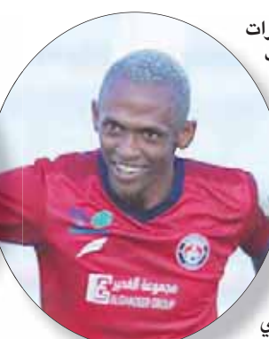
أندريا (الشرق الأوسط)

العناصر والنهج التكتيكي، فإنه ظل عاجزاً عن الوصول للطريقة التي تضمن له تحقيق النتيجة المرغوبة، ومن المتوقع أن تحدث مساء اليوم جملة من التغييرات ستطال اللاعبين الأجانب والمحليين بداية من حراسة المرمى وحتى المهاجمين بعد تراجع عطاء أندريا هدف الفريق الدفاع بالهجوم، وإرسال الكرات الطويلة الساقطة على الأطراف لاستغلال سرعة ومهارة نوز في الهجمات المرتدة السريعة. وعلى الجهة الأخرى، يطمح أصحاب الأرض والجمهور، في وقف نزف النقاط وتحقيق انتصار يعيدهم لاجواء الدوري من جديد، حيث لم يحقق التونسي ناصيف البياوي أي انتصار منذ توليه الإدارة الفنية في الجولات الثلاث الماضية، حتى إن خطه الهجومي لم يستطع هز الشباب خلال الـ270 دقيقة الأخيرة، وهذه النتائج السلبية رمت الفريق في المركز الـ15، وبات من أقرب المرشحين لمغادرة دوري الكبار بعد أن تجمد برصيده النقلي عند 8 نقاط. ورغم التغييرات العريضة التي يحدثها التونسي من جولة لأخرى على مستوى