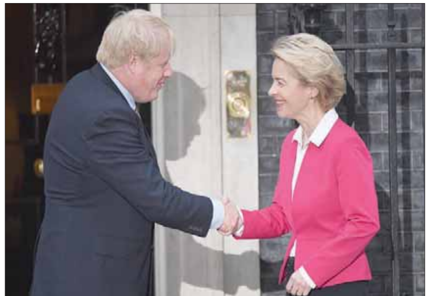
جونسون وفون دير لاين خلال أول اجتماع لهما أمس في لندن بصفتها رئيسة المفوضية الأوروبية

المستحيل التفاوض على كل ما ذكرته والملفات الأخرى كذلك. لذلك، سيستعين علينا تحديد الأولويات، طالما أننا نواجه هذا الموعد النهائي وهو نهاية 2020». وذكرت الحكومة البريطانية، الثلاثاء، أن جونسون سيخبر فون دير لاين في اجتماعهما أن الموعد النهائي «لن يتم تمديد». وستواصل بريطانيا العمل وفقاً لقواعد الاتحاد الأوروبي وتدفع رسوم العضوية خلال المحادثات الانتقالية. وقالت الحكومة في بيانها «بعد الانتظار لأكثر من ثلاث سنوات لإنجاز خروج بريطانيا من الاتحاد الأوروبي، يتوقع المواطنون البريطانيون والأوروبيون أن تنتهي المفاوضات حول اتفاقية تجارة حرة طموحة في الوقت المحدد». إلا أن فون