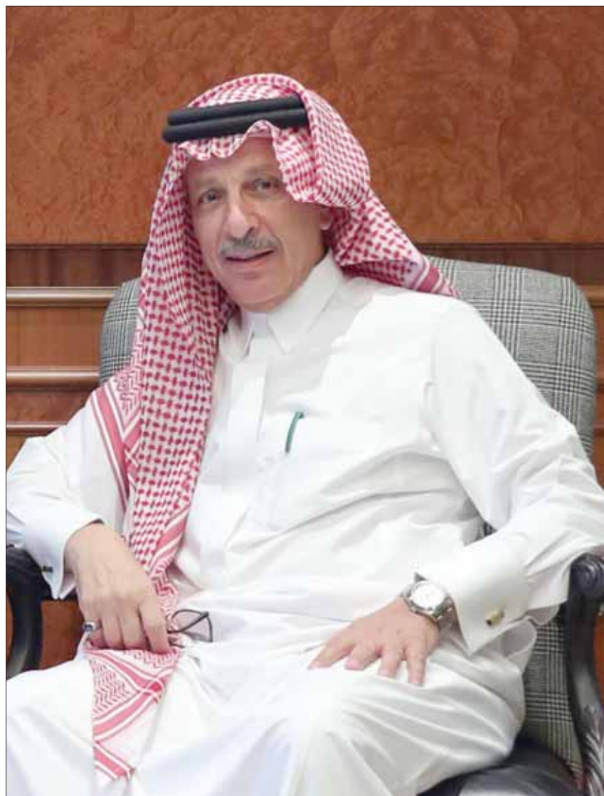
وزير الدولة السعودي لشؤون الدول الأفريقية أحمد قطان

المخدرات والسلاح والاصطاد الجائر وغيرها من المخاطر التي تهدد دول المنطقة كافة. هذا إلى جانب الحاجة لتحقيق السلامة البحرية وتبني استراتيجيات متكاملة بما يضمن حماية سيدة دول الكيان من أي اعتداء وحماية الموارد والحياة الفطرية والطبيعية والثروات الطبيعية الهائلة. وفي الجانب الاقتصادي وللأهمية الاقتصادية التي نشأت منذ وجود شعوب دول الكيان كونه ممرراً للمنتجات