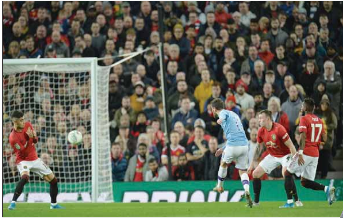
برناردو سيلفا نجم سيتي (في الوسط) يصوب نحو مرمى يونايتد ليسجل أول أهداف فريقه

قد لا يكون جاهزاً للعب في الجولة المقبلة من الدوري الممتاز أمام نوريتش سيتي. في المقابل قال الإسباني جوسيب غوارديولا مدرب سيتي: «الأمر لم ينته بعد» في إشارة إلى خسارة يونايتد 2 - 0 صفر على أرضه أمام باريس سان جيرمان في ذهاب دور الستة عشر بدوري أبطال أوروبا الموسم الماضي قبل أن يفوز 3 - 1 في باريس. وأضاف: «يكل تأكيد مانشستر يونايتد يستطيع العودة. في العام الماضي خسر هنا أمام سان جيرمان وتأهل». وأشار غوارديولا: «كانت الدقائق الأولى متقاربة ولكن سجلنا بعدها هدفاً رائعاً ولعبنا بطريقة جيدة جداً. في الشوط الثاني عبروا أسلوبهم وعانينا قليلاً للاحتفاظ بالكرة». وتابع: «لم تحسم مواجهة بعد لأنه يونايتد هم قادرون على تسجيل الأهداف ولكن نأمل أن نبلغ النهائي مجدداً». وقال سيلفا صاحب هدف سيتي الأول الرابع: «كان بإمكاننا أن نتقدم بباربعة أو خمسة أهداف عند الاستراحة لأننا أهدرنا بعض الفرص. ضغطوا علينا بشكل أكبر في الشوط الثاني، تعبنا ولكننا سعداء». وتابع البرتغالي الذي لعب في مركز رأس الحربة الوهمي في ظل غياب المهاجمين الأرجنتيني سيرجيو أغويرو والبرازيلي غابريال جيسوس: «لقد استمتعت بدوري لأن الأمر نجح وفزنا. أراد غوارديولا لاعباً آخر في المنتصف». ومنذ خسارته أمام يونايتد في الدور الرابع من المسابقة في أكتوبر (تشرين الأول) عام 2016 لم يخسر سيتي في 16 مباراة (12 فوزاً و4 تعادلات) وحقق خلال هذه السلسلة اللقب مرتين في العامين الماضيين.