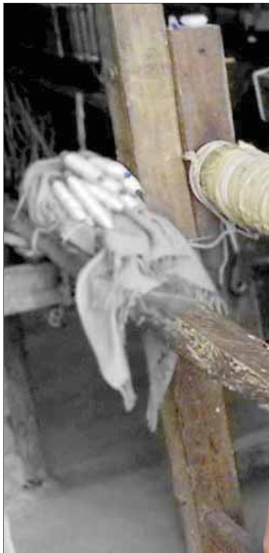
الكادي في طور الإنتاج