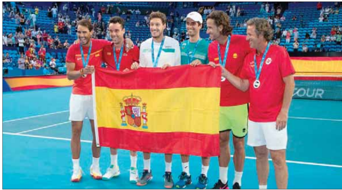
نادال (يسار) يحتفل مع منتخب إسبانيا بالتأهل لربع النهائي

نشره كاننا نخوض كأس العالم في حدها ما.» وعلى غرار ما فعلته ضد فرنسا في الجولة الأولى حين فازت 6 - 7 و 6 - 7، وأقر ديوكوفيتش أن مواجهته مع كيفن أندرسون «كانت أصعب مباراة خضتها هنا في بريزين»، معرباً عن سعادته «بالتحديات التي واجهتها هنا في الأيام الستة أو السبعة الأخيرة، أصل بأن يساعدني ذلك في الوصول إلى أفضل استعداد ممكن لسيدني (حيث تقام الأدوار الإقصائية) وملبورن (حيث تقام بطولة أستراليا المفتوحة ابتداءً من 20 الحالي)». وستتواجه صربيا في ربع النهائي الجمعة مع ثاني أفضل وصيف في المجموعات الست، حيث تعول على نتيجع الجالية الصربية في سيدني بحسب ما أشار ديوكوفيتش، بالقول: «هناك جالية صربية كبيرة في سيدني، أمل بأن تكون المؤازرة كبيرة بقدر ما كانت عليه هنا (بريزين)». وتابع: «إنها مسابقة منتخبات، هكذا تعامل معها وهذا الشعور الذي يراودنا جميعاً، وبالتالي نخوض هذه المغامرة معاً في أماكن مختلفة من أستراليا،