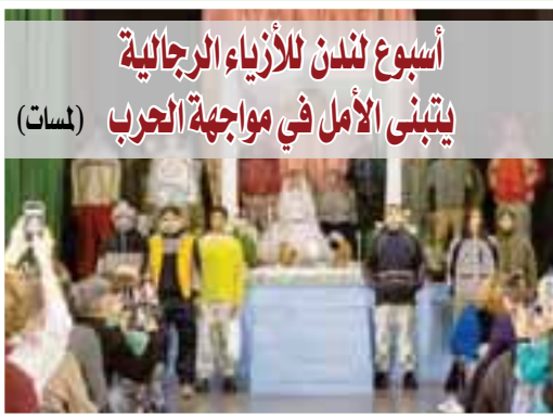
أسبوع لندن للأزياء الرجالية يتبنى الأمل في مواجهة الحرب (لمسات)