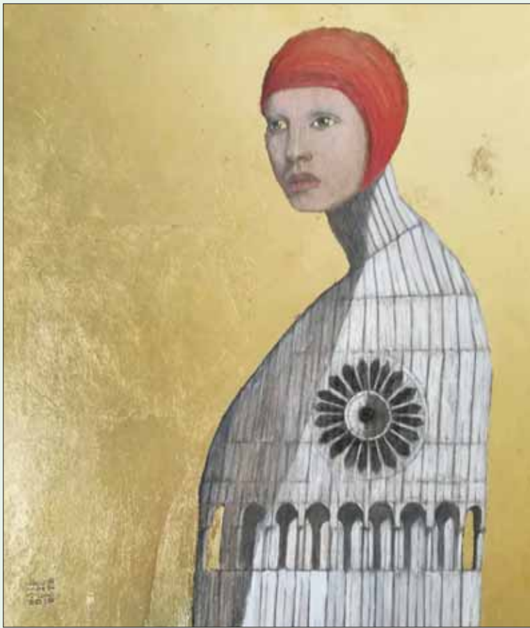
الاستكشاشات تتكامل مع منحوتات المعرض

التناغم بين الملامح البشرية والمعالم المعمارية بأسلوب تجريدي