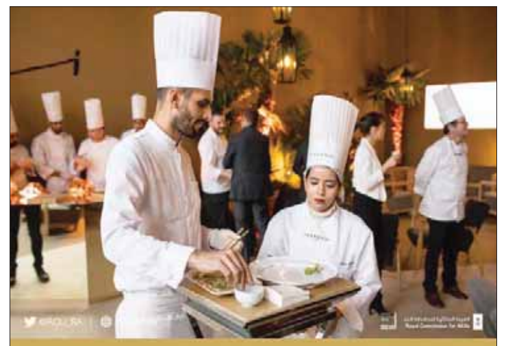
«طهاة العلاء» شباب وشابات سعوديون يستقبلون زوار «شتاء طنطورة»، بأشهى الأطباق الشرقية والغربية