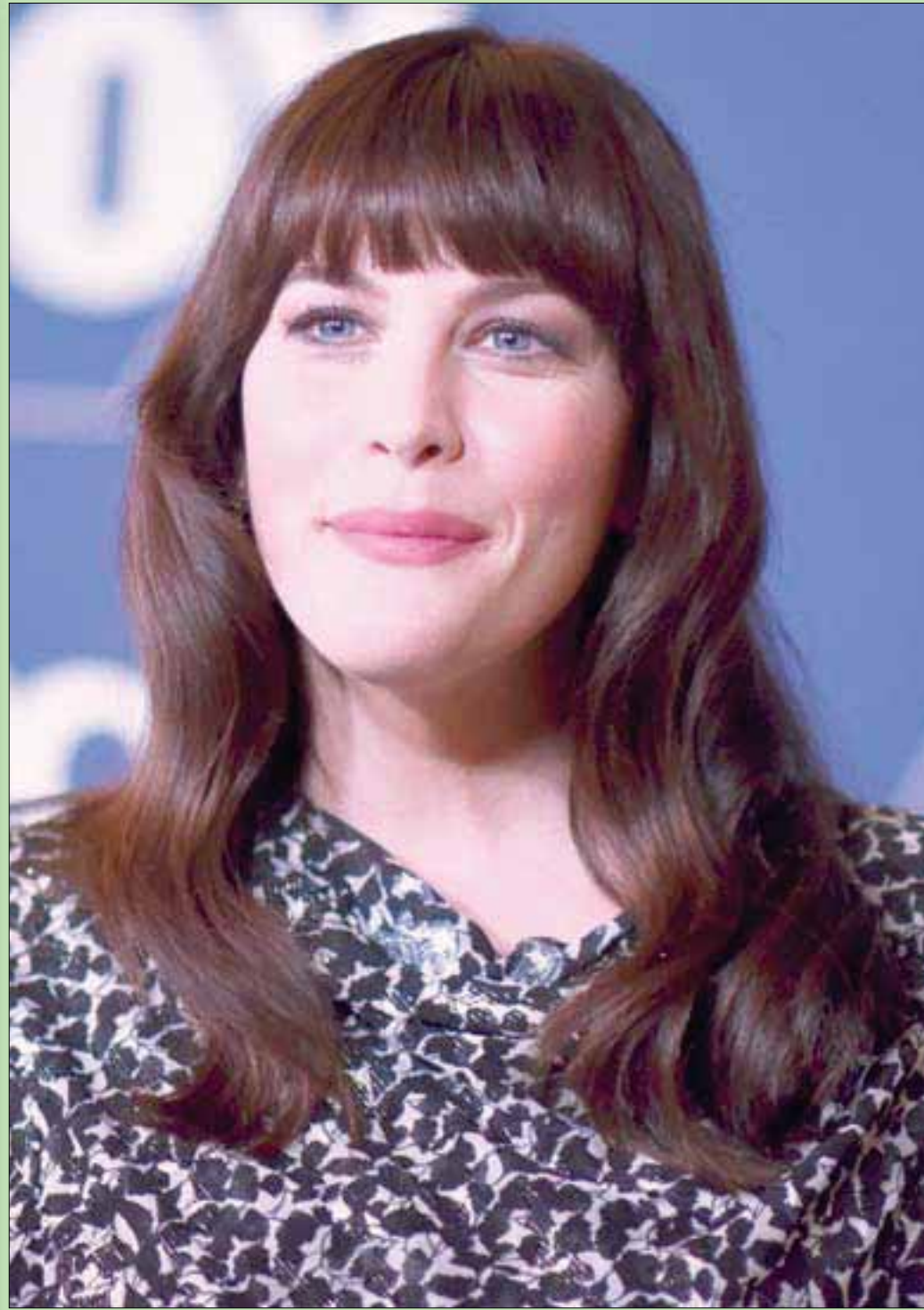
المثلة ليف تايلر خلال حفل «فوكس أول ستار» في لوس أنجلوس أمس

إنني أشبه نفسي بالبيتم الجالس أمام مائدة اللثام وهو مكتوف اليدين، إنه لا يأكل، لكنه فقط يتلمظ، ويدعو عليهم قائلًا: جعلكم ما تحذرونها.