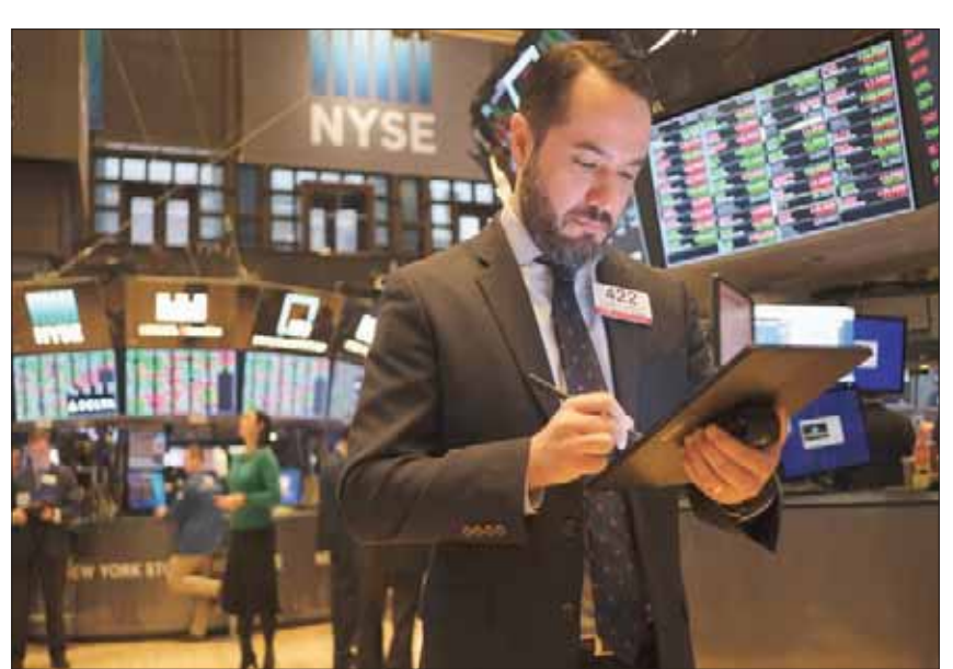
عادت أغلب الأسواق العالمية العاملة ظهر أمس إلى الاستقرار بعد تراجعات صباحية قوية نتيجة المخاوف (أب)

وفي الجلسة الصباحية، هبطت الأسهم اليابانية ما يزيد على اثنين في المائة لتبلغ أدنى مستوياتها منذ 21 نوفمبر (تشرين الثاني) 2019، وتراجع 213 سهماً مقابل ارتفاع 11 سهماً. ونزل المؤشر تويكس الأوسع نطاقاً 1,37 في المائة إلى 1701,40 نقطة.