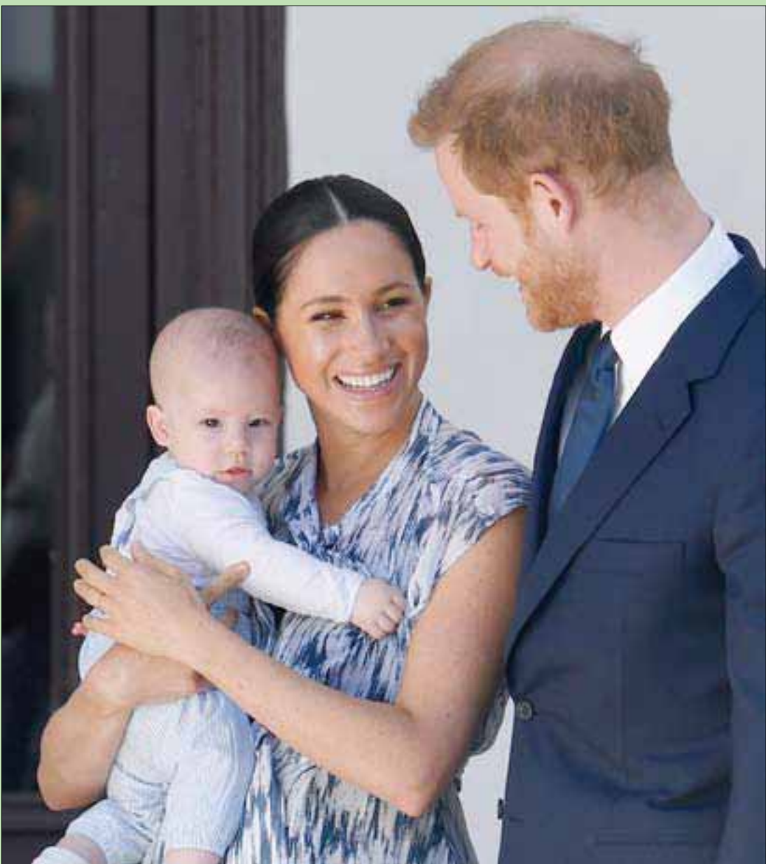
هاري وميغان مع ابنتهما أرشي