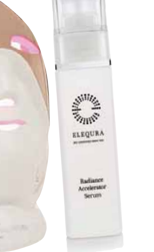
«رادينوس أكسيلاتور سيروم» لتخفيف البشرة وإعاشتها