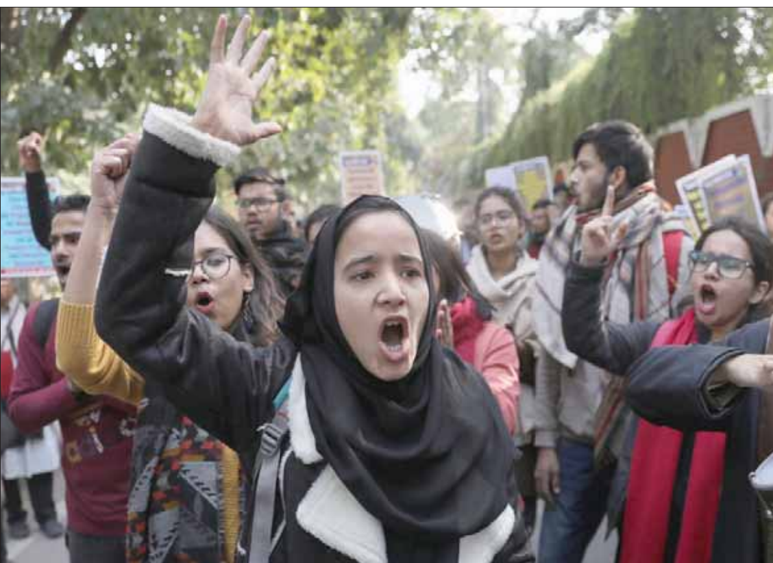
هنديات يقدن الاحتجاجات ضد قانون الجنسية في نيودلهي الجمعة