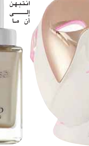
كريم بذرات من الماس من «ناتيرا بيسي» بسعر 516 جنيهًا إسترلينياً على موقع «نيت ابورتيه»

معددة إلى حد قد يجعل البعض يعزف عنه، لكنها تفاجأت بالعكس «الأمر الذي يدل على أن المرأة تريد أن يكون لها أسلوبها الخاص، ولا شيء يوقفها عندما تحصل على شيء مميز». وتوافقها الرأي فيرونيا فيساس، الرئيس التنفيذي لشركة «ناتيرا بيسي»، في حديث خاص لـ«التشرق الأوسط»، قائلة إن الشركة التي تحفل هذا العام بعيد ميلادها الـ40 طرحت بالمناسبة مستحضراً في محلات «هارونز» مكوناً من الأساس (The Cream of Diamond Extreme)، مُقاسماً للشخوخة، بعدد محدود، وبسعر 850 جنيهًا إسترلينياً. سعره تبرره فيرونيا، وهي من الجيل الثالث للمؤسس ريكاردو فيساس، بقولها إن المسألة لا تتعلق بمنتج عادي، بل حياة وأولويات. بأسلوب