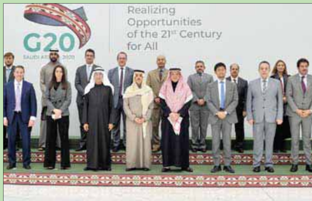
جانب من الصورة التذكارية للوزير مع سفراء ورؤساء بعثات «مجموعة العشرين»

الرياض، «الشرق الأوسط» التقى الأمير فيصل بن فرحان بن عبد الله وزير الخارجية السعودي، سفراء ورؤساء وفود دول «مجموعة العشرين» لدى السعودية، والدول المدعوة للحضور والمشاركة في برنامج رئاسة المملكة للمجموعة، مؤكداً أهمية برنامج المملكة الطموح لسنة رئاسة «مجموعة العشرين»، وأهمية تعزيز التعاون الدولي مع الامانة العامة لـ «مجموعة العشرين». ورحّب وزير الخارجية السعودي في كلمته برؤساء بعثات دول «مجموعة العشرين» لدى السعودية، والدول المدعوة للحضور والمشاركة في برنامج رئاسة المملكة للمجموعة، مؤكداً أهمية برنامج المملكة الطموح لسنة رئاسة «مجموعة العشرين»، وأهمية تعزيز التعاون الدولي مع الامانة العامة لـ «مجموعة العشرين». وتحت إشراف وزير الخارجية السعودي، في مقر معهد الأمير سعود الفيصل للدراسات الدبلوماسية بالرياض، بحضور فهد المبارك وزير الدولة عضو اللجنة العليا واللجنة التحضيرية لاستضافة السعودية لقمة المجموعة، وفهد التونسي المستشار بالديوان الملكي الأمين العام للامانة السعودية للمجموعة.