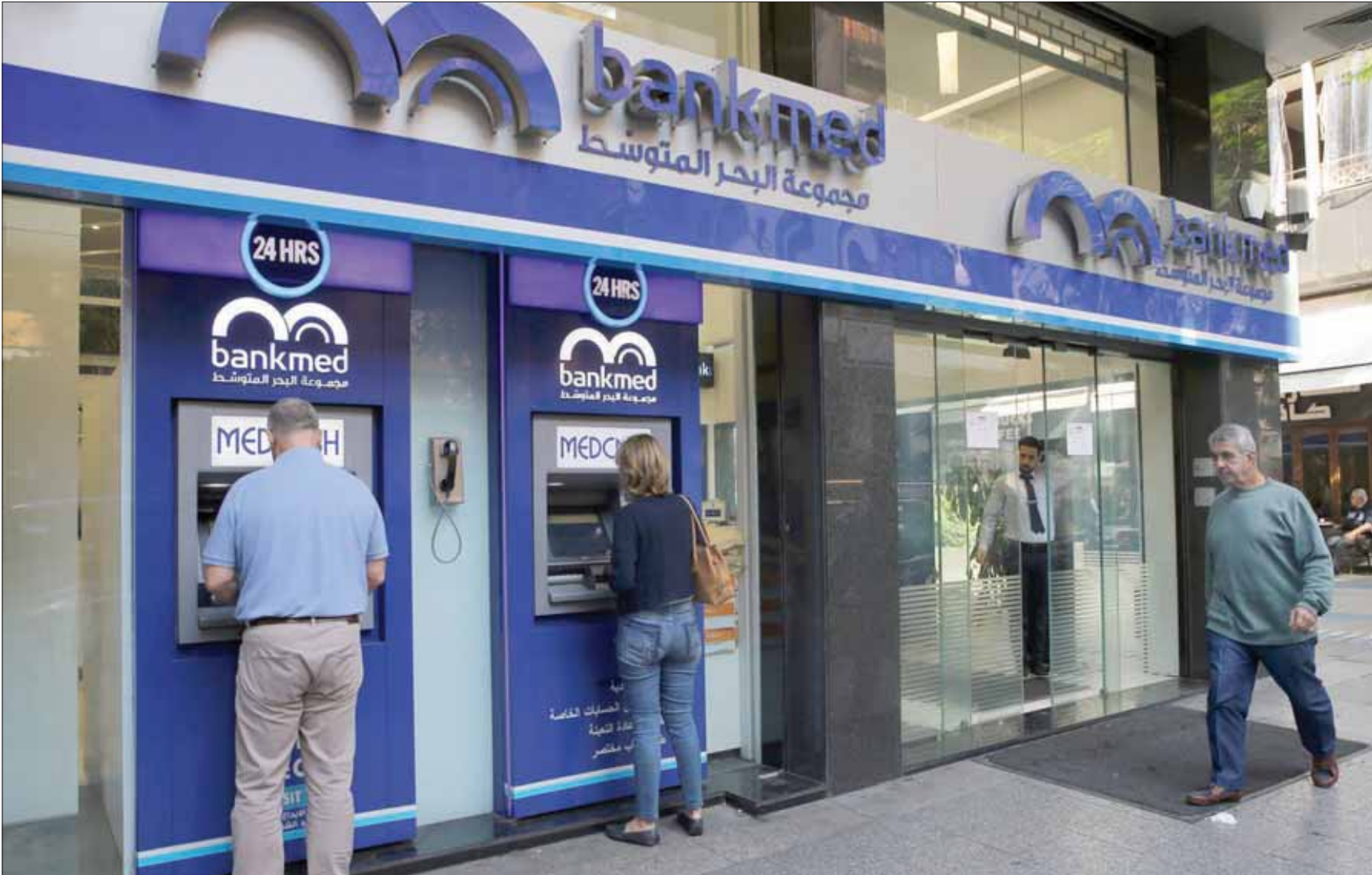
شهد لبنان نزوح أكثر من 6 مليارات دولار من الحسابات المصرفية إلى الخزائن المنزلية خلال الأشهر الثلاثة الأخيرة مع ارتباك الأوضاع الاقتصادية والسياسية

ومالية مطلة إلى يمكن خطر داهم ستميط البيانات المجمعته لنهاية العام اللتام عنه. ففضلا عن نقل نحو 6 مليارات دولار (بالليرة وبالدينار) خلال الأشهر الثلاثة الأخيرة من حسابات المصارف إلى «خزائن المنازل»، وتربق تواصل هذه الموجة في الفترة المقبلة ما دامت قيود المصارف قائمة في الصرف والتحويل والسحوبات، ثمة معطيات متقاطعة تؤكد «نزوح» أموال إلى حسابات خارجية، إنما تفكرت إلى التصني والتدقيق الذي ستقوله لجنة الرقابة على المصارف لتبيان القمعة الإجمالية وطبيعتها وتحديد أصحاب الحسابات، وهي عملية حساسة وذات مفاعيل أكيدة على مسار مكافحة الفساد والأموال العامة المنهوبة الذي تشهده التحركات الشعبية المتواصلة.