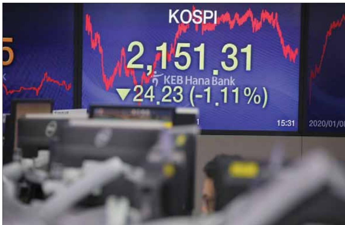
تتهاهب كوريا الجنوبية لزيد من التقلبات المالية وسط ظروف جيوسياسية عالية ضاغطة (إب.أ)