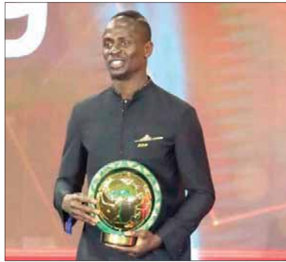
ساديو ماني يتوج بجائزة الأفضل أفريقياً ليمنح ليفربول الريادة

أفضل لاعب أفريقي لعام 2019 وتتويج السنغالي الدولي ساديو ماني نجم هجوم ليفربول بالجائزة الأهم. ففاز ليفربول بخطة مهمة، متقدماً على مانشستر سيتي في صراع من نوع خاص بعيداً عن صراعهما على لقب الدوري الإنجليزي أو على فارق النقاط بين الفريقين في المسابقة المحلية الأوقى في العالم. وكان الصراع هذه المرة على رقم قياسي حسم لصالح ليفربول من خلال التصويت على جائزة أفضل لاعب أفريقي لعام 2019. وانحصر الصراع بين المصري محمد صلاح والسنغالي ساديو ماني نجمي خط الهجوم في ليفربول والجزائري رياض محرز نجم مانشستر سيتي على الجائزة قبل أن يحتل ماني الصدارة في التصويت على الجائزة متفوقاً على صلاح ومحرز اللذين احتلا المركزين الثاني والثالث. وبمجرد إعلان الفائز بجائزة