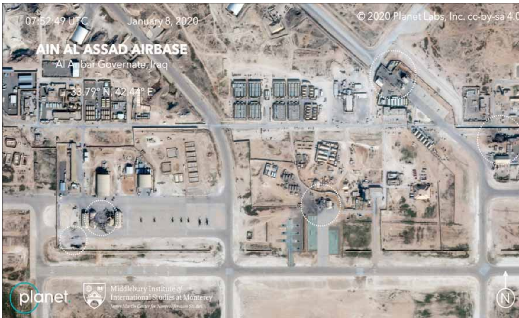
صورة عبر الأقمار الصناعية من معهد «ميدلبوري للدراسات الدولية» و«بلانيت لايس إنك» تُظهر آثار الضربة الإيرانية التي استهدفت قاعدة «عين الأسد» في الأنبار غرب العراق (أ.ب)

وأضاف عبد الله أن «إيران أرسلت عبر هذه الصواريخ رسائل للاميركان بشأن قدرتها على الرد في الوقت المناسب وبطريقة ترضي فيها ذات تأثير على الأميركيين، فضلاً عن رسالة إلى المجتمع الدولي، خصوصاً أن وزير خارجية إيران، جواد ظريف، أعلن أن كل شيء قد انتهى، وهو ما يعني أن إيران مستعدة للجولوس حول طائلة المفاوضات».