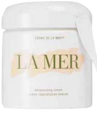
كريم «لامير» يقدر سعره بـ1550 جنيهًا إسترلينياً

سوداء، فإن حمض الهيالورونيك لن يفيدنا، فهي في هذه الحالة تحتاج إلى مكون يتفاعل أكثر مع التصبغ المفرط»، حسب قول فيرونيا. أما إذا كان الهدف هو وقاية البشرة من التلوث بسبب العيش في مدينة صاخبة مزدهمة ف«لا بد من التفكير في مكون قوي من البريبايوتيك يحمي البشرة، ويعمل كطبقة واقية لها».