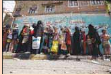
وعدا حوثي برقع راتب يفاقم سخط الليبيين

بغداد: فاضل الشمي أعلن «الحشد الشعبي» أن جثمان نائب رئيسه السابق أبو مهدي المهندس سيورى الترى في النخف بعد إجراء فحص الحمض النووي له في إيران. وقالت الهيئة، في بيان، أوردته وكالة الأنباء الألمانية، أن «تشابك الأشلاء» بين جثامين المهندس وقنصل آخر من «الحشد» وقاسم سليماني ومرافقيه استدعى إجراء الفحص لأجسادهم في العاصمة الإيرانية طهران، بعدما تحولت إلى أشلاء من شدة تفجر الصاروخ الأميركي. إلى ذلك، شهدت ساحات المظاهرات في الناصرية والبصرة، أمس، توتراً شديداً بينها وبين عناصر «الحشد الشعبي» على خلفية رفضها القبول بدخول موكب التشييع الرمزي الذي نظمته «الحشد» لقائد فيلق «القدس» الإيراني قاسم سليماني ونائب رئيس هيئة «الحشد» أبو مهدي المهندس إلى ساحتي الاعتصام في المدينتين الجنوبيةتين. وأدت التوترات بين الجانبين إلى سقوط ما لا يقل عن 3 جرحى، حالة أحدهم خطيرة، في الناصرية، مركز محافظة ذي قار، بعد أن فتحت عناصر «الحشد» النار لتفريقهم، ورد المظاهرون بحرق مقر «الحشد». (تفاصيل ص 4)