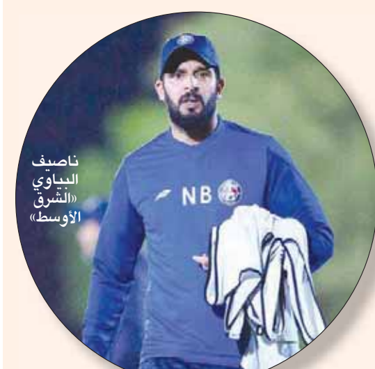
ناصر البياوي الشرق الأوسط

الدمام: علي القطان وسجل صانداو هدفاً لفريقه ضد الشعلة في بطولة الكأس والتي كسبها العدالة بفريقين نظيفين تاهل على أثر ذلك للدور ربع النهائي لمواجهة النصر في الأحساء. ويرتبط صانداو الذي يلعب في خط الدفاع بعقد لمدة عامين مع العدالة، وسبق له أن خاض تجارب جيدة مع فرق العين الإماراتي والفتح الريايطي ونيابري السنغالي إضافة إلى الفتح السعودي. ويستعد العدالة لمواجهة