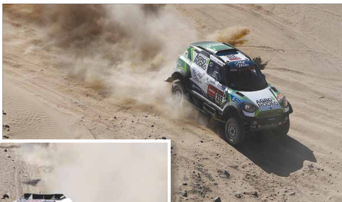
الليتواني فايدوتاس زالا حقق مفاجأة أمس في رحلته من جدة إلى الوجه

كما تستضيف القرية متحف «اكتشف داكار»، الذي يحتوي على مواد مصورة ومرئية توثق تاريخ الرالي الأعرق في العالم، وتقديم لمحة عن المملكة العربية السعودية وتاريخها وثقافتها الأصيلة.