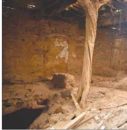
مسجد قرية المد قبل الترميم