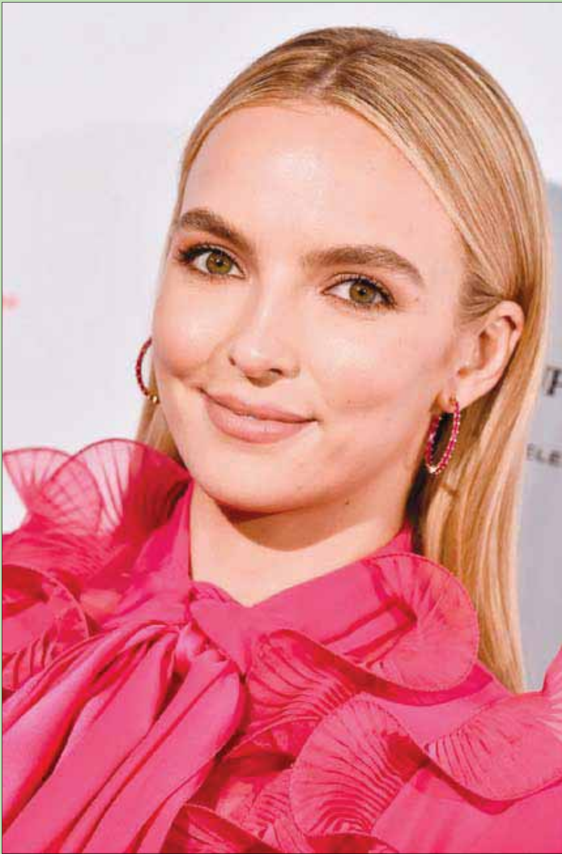
المثلة البريطانية جودي كومر في حفل توزيع جوائز الأكاديمية البريطانية للأفلام «بافتا» في لوس أنجلوس بكاليفورنيا

الحلف الثلاثى الإبليسى، اليسار الموتور و«الإخوان» والخمينية، هم الذين يتكئون اليوم قاسم سليمانى والمهندس، وكل مهندسى الخراب.