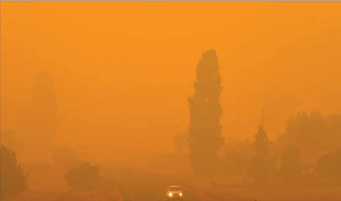
ضباب أحمر كثيف غطى سماء بيمبوكا في ولاية نيو ساوث ويلز أمس

في غضون ذلك، كثفت الشرطة دورياتها في بعض المناطق الريفية التي طالتها الحرائق، وذلك نهب ورود أبناء عن أعمال نهب وسقوط على منازل متضررة. وغالباً ما تشهد أستراليا في الربيع والشتاء حرائق. لكنها حلت في هذا الموسم أبكر من موعدها، وكانت أكثر انتشاراً وضراوة؛ خصوصاً بسبب الظروف المناخية المواتية للحرائق والشتاء عن الاحتباس الحراري.