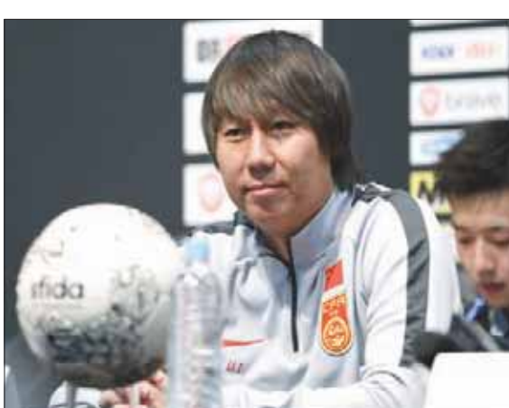
لي تاي مدرب المنتخب الصيني (الشرق الأوسط)

وبهذا أصبح لي ثاني مدرب صيني يتولى المسؤولية الكاملة عن تدريب منتخب بلاده، منذ تعيين الإسباني خوسيه أنطونيو كاماتشو في 2011؛ لكن لي أكد أن الجنسية لا علاقة لها بقدراته التدريبية قائلاً: «لا أريد الحديث عن الفوارق بين المدربين الصينيين والأجانب؛ لأنني أعتقد أنه على مستوى كرة القدم يكون الحكم فقط على مدى الكفاءة، والقدرة على أداء المهمة أو عدمها».