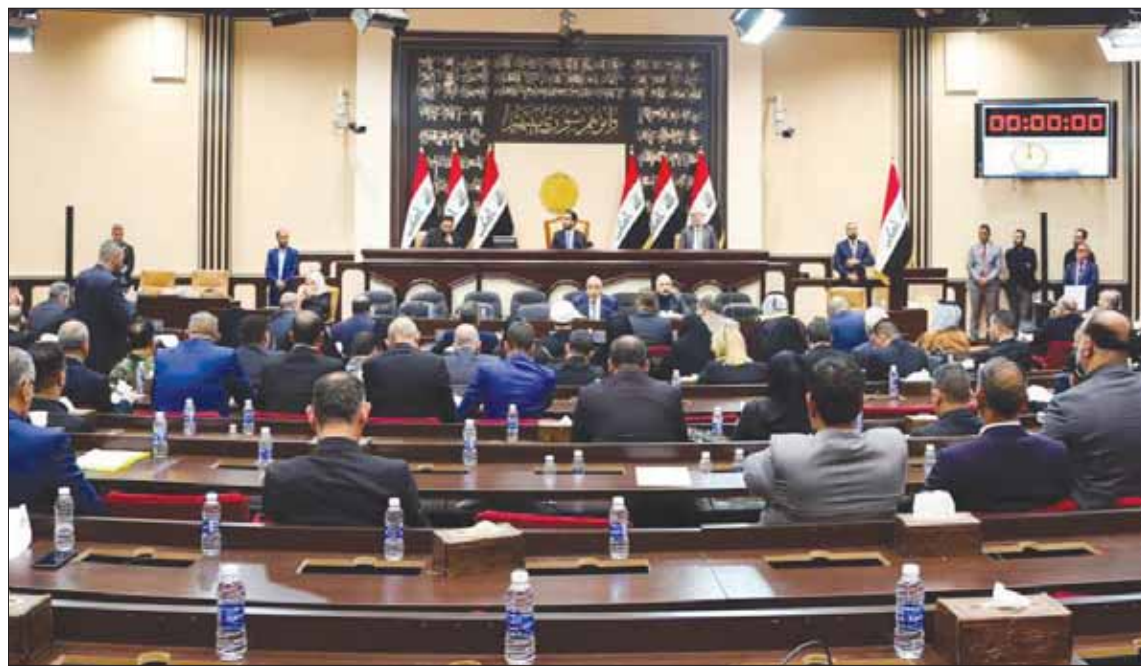
جانب من جلسة البرلمان العراقي لمناقشة «الوجود الأجنبي» أمس

وطبقاً لمصدر أمني فإنه «لا توجد في الواقع اتفاقية أمنية بين العراق والولايات، وإنما كان طلب الدعم من الولايات المتحدة في نهاية يونيو (حزيران) 2014 وهو طلب حكومي تنفيذي وفق تقدير الموقف بتلك الظروف الذي من خلاله دخل التحالف الدولي للعراق». وأضاف المصدر الأمني لـ «الشرق الأوسط» طالباً عدم الإشارة إلى اسمه أن «اتفاقية الإطار الاستراتيجي