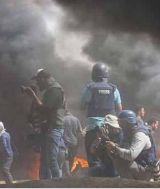
صحافيون فلسطينيون خلال عملهم في الميدان