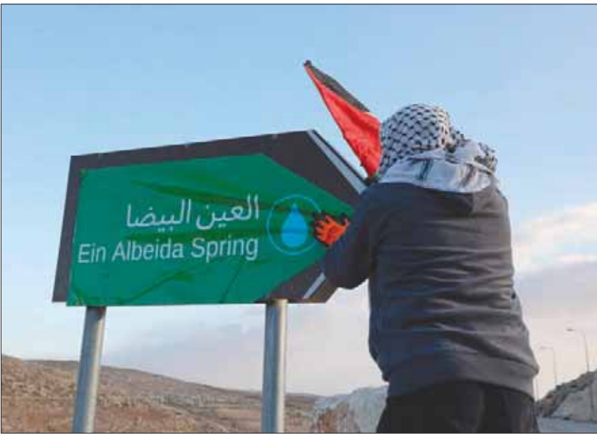
فلسطيني يعيد لافتة بلدة عين البيضا جنوب الخليل التي أسماها مستوطنون «أفيجيل سبرينغ»

أراض محتلة، يمكن أن تكون ضمن التحقيقات ضد مسؤولين إسرائيليين بالضلوع في جرائم حرب بحق الفلسطينيين». كانت هذه المصادر قد أشارت إلى أن نتنياهو أقدم على تشكيل هذه اللجنة، لغرض، وخوفاً من اتهام الجنين المتشد له بالتراجع عن تصريحاته بضم المطلقين. وقالت إن «الغاية طمأنة الرفاق في اليمين بأن فكرة الضم لم تقلع، ونتنياهو لم يرضخ للضغوط الدولية. لكن اللجنة، التي تضم ممثلي كل الوزارات المعنية، وكذلك الجيش الإسرائيلي ومجلس الأمن القومي، باشرت البحث بكل جدية في الخطوات العملية لترحيل، وقلقه من تصريحات ووعود نتنياهو إلى لغة الفعل، وتعد لتقديم مشروع قرار بهذا الشأن، وتفحص ما هو الأفضل، هل صياغة مشروع