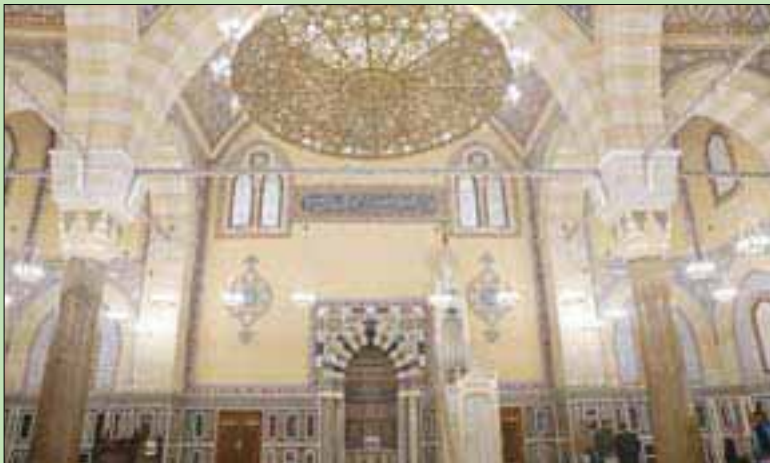
القاهرة: فتحة الداخنة

بقباب نحاسية ومئذنة فريدة، يطل مسجد الفتح الملكي على قصر عابدين، والتي العتيق الذي يحمل الاسم نفسه، وسط العاصمة المصرية القاهرة، وتستعد وزارة السياحة والآثار المصرية لافتتاح المسجد، الأسبوع المقبل، بعد الانتهاء من مشروع ترميمه وتطويره، الذي استغرق نحو 3 سنوات، بتكلفة 16 مليون جنيه (الدولار الأميركي يعادل 16 مليوناً مصرية)، بهدف إعادة المسجد إلى سابق عهده كمنارة تزين الجزء الشرقي من قصر عابدين التاريخي.