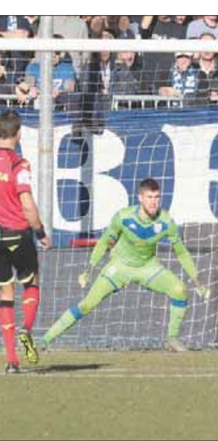
إيموبيلي نجم لاتسيو (يمين) يسجل ثاني أهدافه في مرمرى بريشيا

وكان هذا الهدف الخامس لبالوتيلي في الدوري، والأول له على ملعب بريشيا الذي انضم إلى صفوفه في صيف 2019 من مرسيليا الفرنسي، إلا أنه لم يهنا به كثيرا لأنه تعرض لإصابات متعصبة من جمهور لاتسيو ما دفع الحكم إلى إيقاف المباراة لبعض الوقت مع توجه