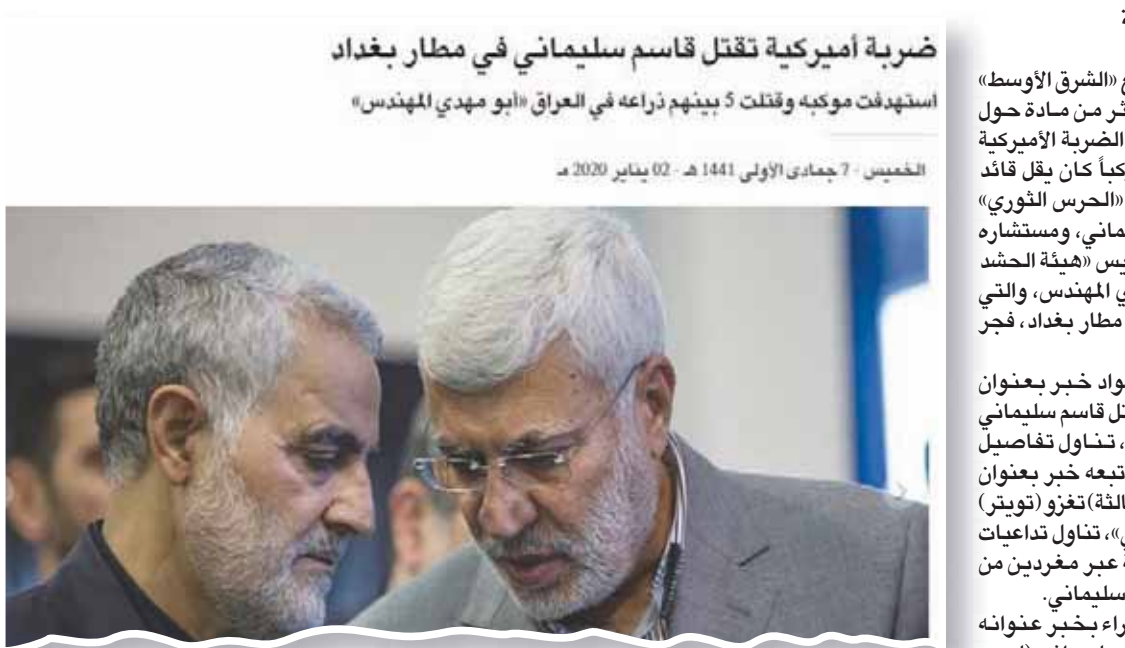
القاهرة، يسرا سلامة

ضربة أميركية تقتل قاسم سليمانى في مطار بغداد استهدفت موكبه وقتلت 5 بينهم ذراعاً في العراق «أبو مهدي المهندس»