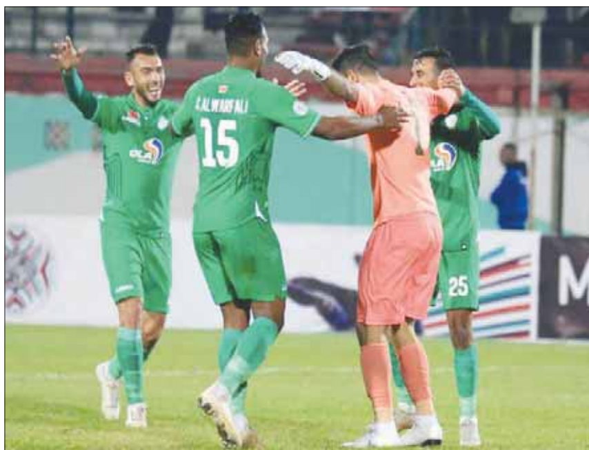
فرحة لاعبي الرجاء بهدفينهما في شباك مولودية الجزائر