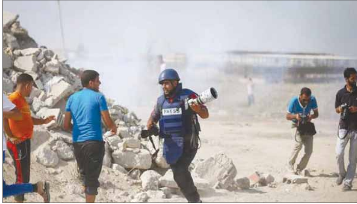
صحافي فلسطيني يهرب من القنابل الغازية في الميدان