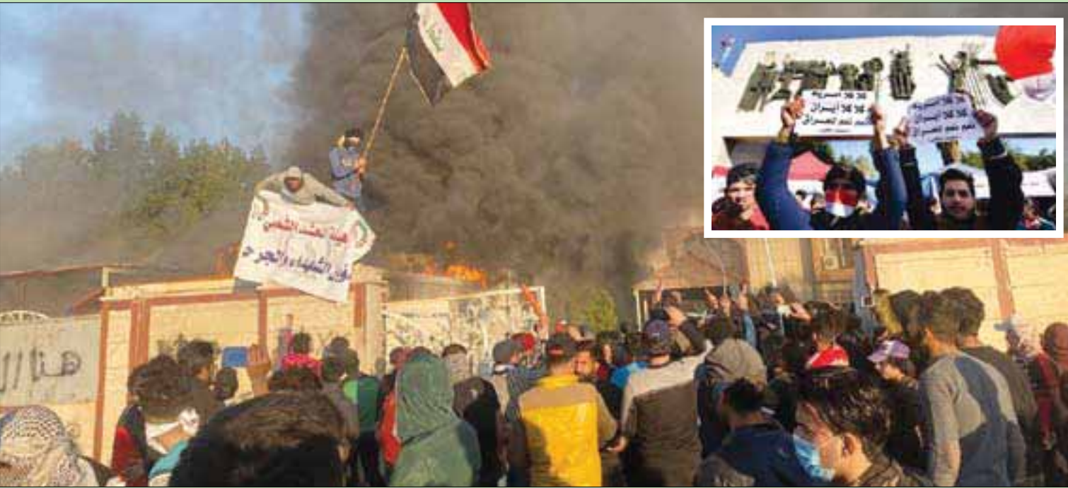
محتجون يحرقون مقراً لـ «الحشد» في الناصرية جنوب العراق أمس... وفي الإطار مظاهرون يرفعون لافتات في ساحة التحرير ببغداد ترفض الوجودين الإيراني والأميركي

بغداد - واشنطن - لندن - الرياض - الشرق الأوسط بعد ساعات من انتهاء مهلة حذدها فصيل «كتائب حزب الله» الموالي لإيران لقوى الأمن العراقي بالابتعاد عن أماكن وجود القوات الأميركية بدأ من الساعة الخامسة عصر أمس بالتوقيت المحلي سقطت صواريخ قرب محيط السفارة الأميركية في المنطقة الخضراء ببغداد، وأفادت تقارير بسقوط أحد الصواريخ على منزل ما أسفر عن جرح بعض ساكنه. إلى ذلك، كشف وزير الخارجية الأميركي مايك بومبيو عن تخلي واشنطن عن استهداف وكلاء إيران والتركيز بدلاً منهم على «صناع القرار» في طهران. وتعليقاً على مقتل قائد فيلق القدس الإيراني قاسم سليماني ونائب رئيس هيئة الحشد «العراقي» أبو مهدي المهندس في ضربة جوية أميركية ليل الخميس - الجمعة قرب مطار بغداد، انتقد بومبيو تعامل إدارة الرئيس السابق باراك أوباما مع الخطر الإيراني وقال: «الديناميكا مختلفة تماماً. أبلغنا الإيرانيين: كفى، لا يمكن أن تفلتوا باستخدام الولاء وتظلوا أن بلادكم ستكون في أمن وأمان. سنرد على صنّاع القرار الغفليين الذين يسببون هذا التهديد من إيران». من جهتها أعلنت إيران أمس «المرحلة الخامسة والأخيرة» من برنامجها القاسي بخفض التزاماتها الدولية التي نص عليها الاتفاق النووي، وأوقفت أي قيود تشغيلية بما في ذلك تلك التي تخص قدرة تخصيب، ونسبته، وكمية المواد المخصبة، والبحث والتطوير، وحسب وكالة أنباء فارس الإيرانية. من جانبه، دعا البرلمان العراقي أمس الحكومة إلى «إنهاء وجود أي قوات أجنبية» في العراق عبر المباشرة بـ «إلغاء طلب المساعدة» المقدم إلى المجتمع الدولي لقتال «تنظيم داعش».