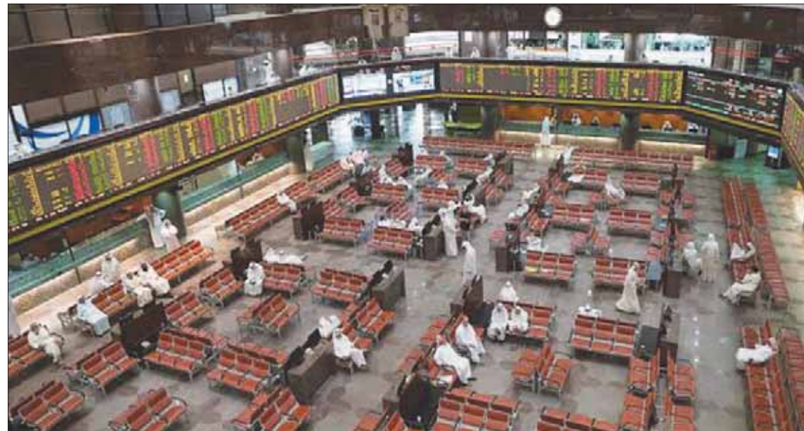
متعاملون يتابعون أسعار الأسهم في بورصة الكويت