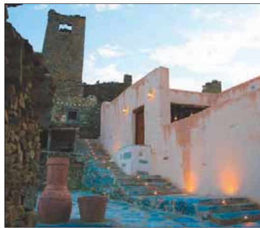
مسجد الأطاوله التراثي (الأطاوله - الباحة) بعد ترميمه

بالبطين واستخدام الأخشاب المحلية التي تتميز بها كل منطقة. ويأتي الدعم للمساجد التاريخية، وفق بيان صحافي، لمكانتها الدينية وما تتمتع به من أصالة في التصميم العمراني، ومواد البناء بما يتوافق مع الطبيعة الجغرافية والمناخية ومواد البناء في مختلف مناطق المملكة. وبدأت أعمال الترميم بإجراء الدراسات وتوثيق الأبعاد التاريخية والمعمارية لكل مسجد، واستعراض جميع التحديات التي تحيط بالمساجد من حيث التسهيلات والخدمات التي يجب توافرها ومدى خدمة كل مسجد للمحيط الذي يقع فيه، فضلاً عن المحافظة على الطراز المعماري الذي يميز كل منطقة من مناطق السعودية، التي تعتمد في بعضها على البناء بالأحجار وأخرى بالبطين واستخدام الأخشاب المحلية التي تتميز بها كل منطقة