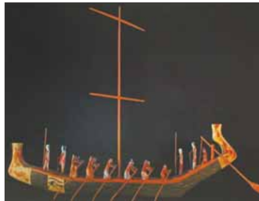
من القطع التي أرسلت من الشارقة إلى مصر (وام)