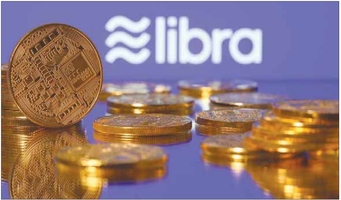
سيتغير مفهوم التعاملات المالية بإطلاق «ليبرا» وهو ما جعل اليابان تسعى لإنشاء شبكة مدفوعات للعملات المشفرة

تبادل العملات المشفرة في 2017. كانت مجموعة العمل المالي وافقت في يونيو الماضي، على خطة لإنشاء الشبكة الجديدة التي اقترحتها وزارة المالية وكالة الخدمات المالية في اليابان. وتدفع طوكيو في اتجاه ضمان أمن العملات الافتراضية على أمل الاستفادة من قطاع التكنولوجيا المالية لتحفيز النمو الاقتصادي.