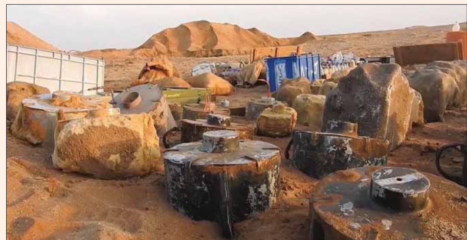
جانب من عمل المشروع السعودي لنزع الألغام في اليمن (مسام)

الدرهيمي، جنوباً، ما أسفر عن اندلاع المعارك وإجبار الميليشيات الانقلابية على التراجع والفرار بعد مواجهات استمرت لساعات. تزامن ذلك، مع استهداف الميليشيات الانقلابية مواقع تقع تحت نطاق نقاط المراقبة المشتركة، التي وضعتها لجنة المراقبة الاممية في مدينة الحديدة، حيث أفادت ذات المصادر بأن «ميليشيات الحوثي الانقلابية تواصل اختراقها للمهدة الاممية دون احترام لأي عهد أو وعود اطلقتها، وذلك من خلال القصف المستمر على مواقع القوات المشتركة بما فيها مواقع وجود القوات الارتباط الأولى في شارع الخسيس بمدينة الحديدة مستخدمة مختلف الأسلحة».