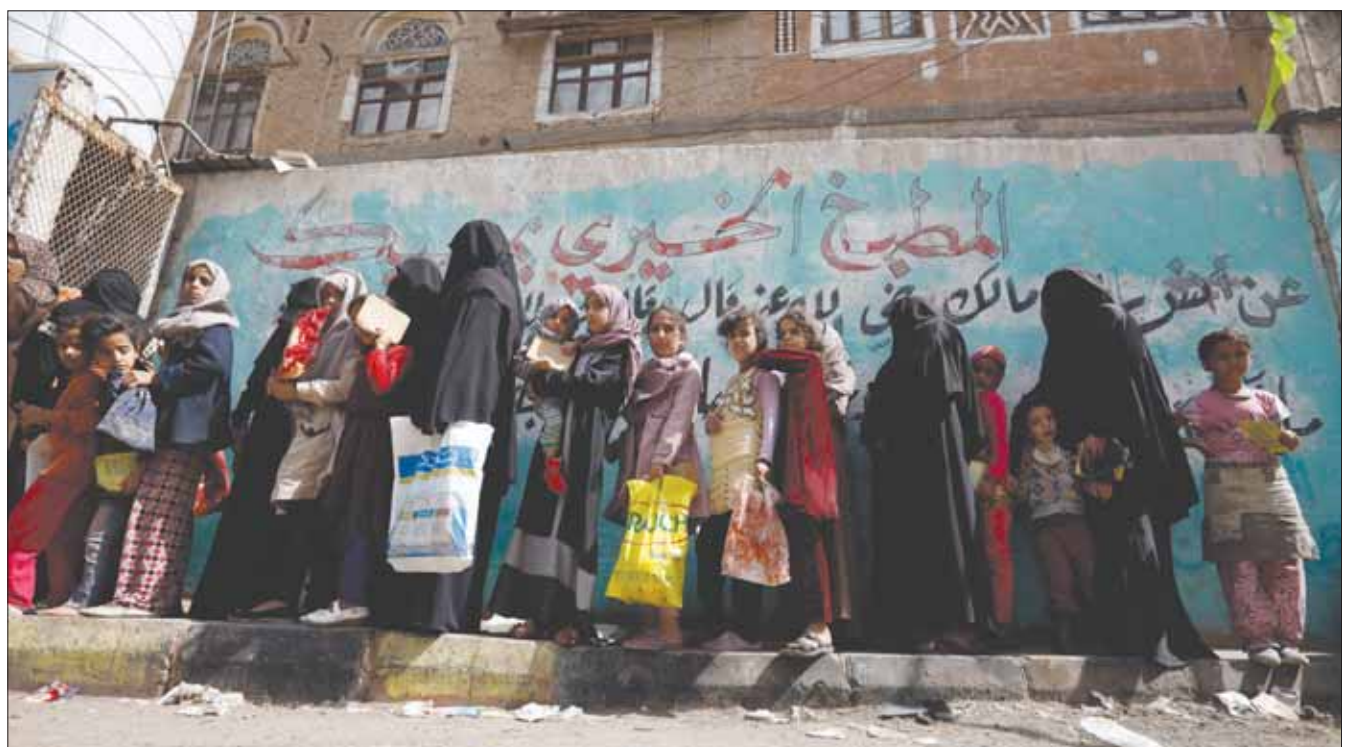
تردي الأوضاع الاقتصادية دفع بعض المحتاجين إلى الاصطفاف أمام الجمعيات الخيرية التي تقدم الطعام في صنعاء (إبأ)

تعدى الأوضاع الاقتصادية دفع بعض المحتاجين إلى الاصطفاف أمام الجمعيات الخيرية التي تقدم الطعام في صنعاء (إبأ)