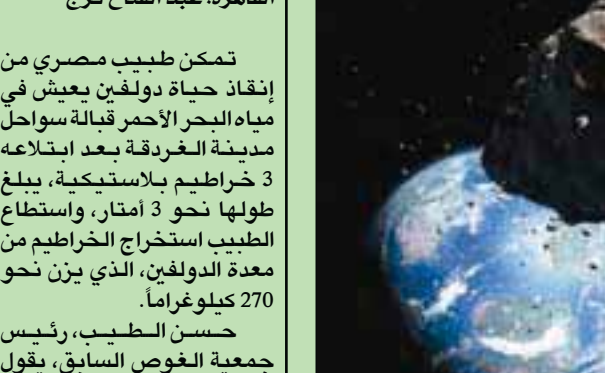
كويكب سيقرب من الأرض

حيث تقول الوكالة إنه يمكن مقارنة الطرف العلوى من الصخرة في ارتفاعها مع برج أوستانكينو في موسكو، أما الطرف السفلى، فيبلغ طوله نحو طول جسر البوابة الذهبية في سان فرانسيسكو، الولايات المتحدة. وفقاً لوكالة الفضاء الأوروبية (إي. إس.إيه) فإنه يوجد حالياً 21702 كويكب أو أجسام أخرى قريبة من الأرض، وهي صخور فضائية تعبر أحياناً مدار الأرض. وعلى رأس القائمة الواسعة التي نشرتها وكالة الفضاء الأوروبية فإنها ذكرت 997 كويكباً يمكنها تشكيل «خطر» على سلامة الأرض، ولكن لحسن الحظ، فإن «ناسا» لا تتوقع أن يقترب الكويكب OU، يوم الجمعة المقبل، من الأرض بشكل كاف للاصطدام بها.