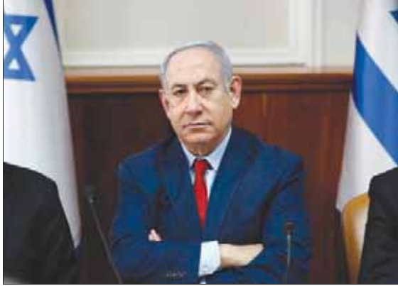
بنيامين نتنياهو رئيس الوزراء الإسرائيلي في اجتماع الحكومة أمس

اعتقال قاسم سليمانى كان بمثابة «هدية السنة الجديدة» لنتنياهو، إذ إنه محسوب كمن يقود الاتجاه العدائي لإيران في المنطقة وهو يتباهى بهذا كثيراً ويدعي أنه هو الذي أقع الرئيس دونالد ترمب بتشديد القبضة على زعماء طهران، بالانسحاب الأميركي من الاتفاق النووي وحتى الإجراءات الميدانية ضد النفوذ الإيراني المتنامي في المنطقة. ويرى هؤلاء الخبراء أن الوضع الأمني الجديد يساعد نتنياهو على إخراج ناخبي اليمين المتعاطفين من البيت، خصوصاً أولئك الذين سئموا منه في السابق بسبب الفساد، ولكنهم سيضعون ذلك جانباً من أجل إنقاذ الدولة من إيران. واعتبر هؤلاء خروج بعض قادة «القائمة المشتركة»، ضد اعتقال سليمانى، سيحقق لليمين الإسرائيلي مراده ويبعد هذه القائمة عن الأندماج في ائتلاف مستقبلي مع غانتس، وتبعث على اليأس في أوساط عرب صوتوا في الانتخابات الأخيرة أصلاً في الإندماج في القيادة الإسرائيلية. ويقولون إن «بقاء نتنياهو مرتبط إن بنجاحه في الحفاظ على جدول الأعمال الأمني في العناوين في الأسابيع الثمانية القادمة».