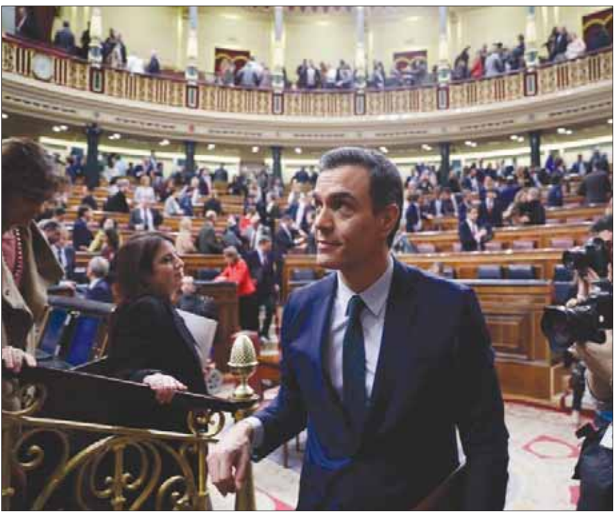
سانشيز يغادر البرلمان الإسباني في مدريد أمس

العنيف الذي بدأ يُعيد الانتخابات الأخيرة مطالع نوفمبر (تشرين الثاني) الماضي، عندما أعلن سانشيز عن توصله إلى اتفاق مع حزب «بوديموس» اليساري لتشكيل حكومة تقدمية، وأنه سينفاوض مع القوى الانفصالية اليسارية بهدف الحصول على تأييده أو امتناعها عن التصويت لتشكيل الحكومة الجديدة. كما يندرج هذا الهجوم في سياق استراتيجي للحزب الشعبي لاستعادة الحكومة، بعد أن تمكن في الانتخابات الأخيرة، وبعكس التوقعات، من استرداد مقعده كقوة ثنائية في المشهد السياسي. ويدرك هذا الحزب، الذي تناوب على الحكم في إسبانيا مع الاشتراكيين منذ عودة الديمقراطية أواخر سبعينات القرن الماضي، أن حكومة سانشيز التي رهنت بقاءها للقوى الانفصالية، قد تسقط عند أول اختبار دقيق مع هذه القوى، ما يشرع أمامه الأبواب للفوز في الانتخابات المقبلة بعد الانهيار الطويل الذي يكون سانشيز قد راكمه بسبب عدم تمكنه من تشكيل حكومة مستقرة للمرة الثالثة على التوالي.