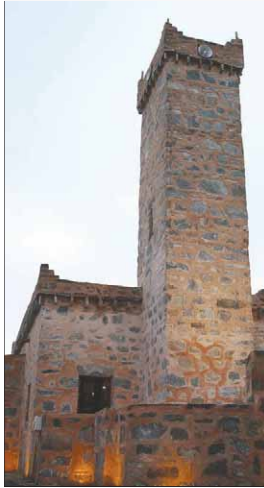
مسجد الظفير التراثي (الباحة) بعد الترميم