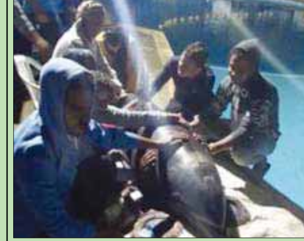
فريق الإنقاذ مع الدولفين

يتم فيها إجراء مثل هذا النوع من العمليات على يد الطبيب «المصرى». وخلال الأعوام الماضية تم إنقاذ دلافين عدة بيماء البحرين الأحمر والمتوسط في مصر من قبل نشطاء حماية الحياة البحرية، لكن الطيب يؤكد أن ضعف الإمكانيات والتجهيزات الطبية والفنية تعوق عمليات إنقاذ الحيوانات البحرية الكبيرة، مثل القروش والحيتان في كثير من الأحيان. ووفق الطبيب، فإن الدلافين تتميز بعلاقتها الجيدة مع البشر. لافتاً إلى أن الدلافين تعيش قبالة سواحل شمال مدينة الغردقة.