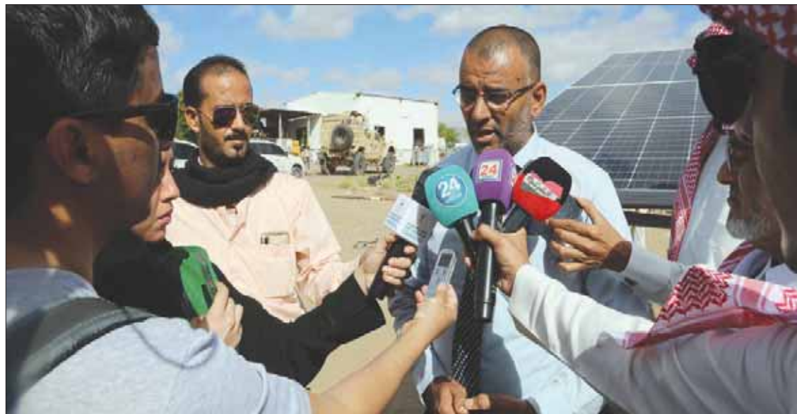
حيدرة رئيس حقل المناصرة لدى تحدث مع وسائل الإعلام