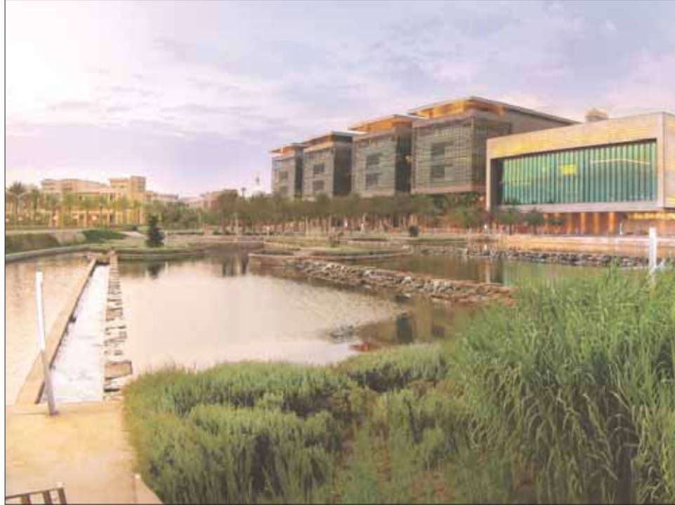
جامعة الملك عبد الله للعلوم والتقنية (كاوست)

منظومة الابتكار. وعندما التحقّت بمجال العمل هذا، كان يُنظر إلى الجامعة بوصفها مصدراً للابتكارات، وبراءات الاختراع، والتراخيص، والشركات المنبثقة. ولكن تشير دراسة بريطانية حديثة إلى أن الملكية الفكرية تمثل 2 في المائة فقط من مجموع تدفق المعارف من القطاع الجامعي.