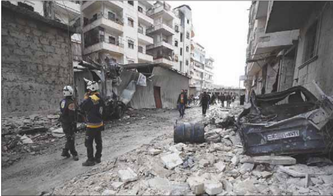
عنصران من قوات الدفاع المدني وسط دمار لحقته غارات الطيران بمناطق في أريحا أمس

محافظة إدلب ومناطق محاذية لها في محافظات مجاورة نحو ثلاثة ملايين نسمة نصفهم من النازحين من مناطق أخرى. وشنت القوات السورية بدعم من روسيا هجوماً واسعاً بين