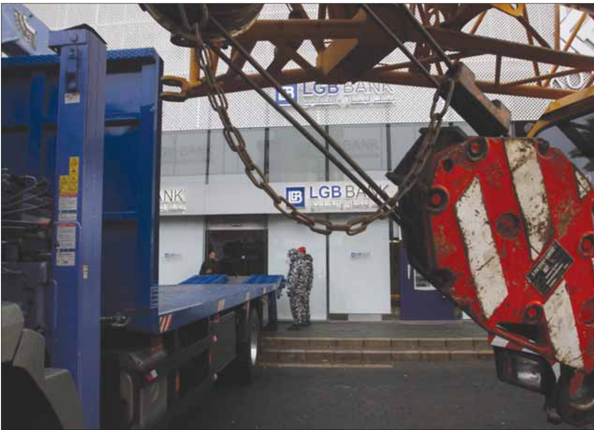
لبناني يخلق مدخل بنك باشاعة بعد أن رفض فرع المصرف في صيدا السماح له بسحب مديراته

وفي ظل الانتقادات التي يتعرض لها مسار تشكيل الحكومة، اعتبرت النائبة في كتلة «قبّوت» ديمًا جمالي، أن هناك من يغلب المصلحة الشخصية على البلاد. وكتبت جمالي على حسابها في «تويتر»: «من الألفاظ أن معظم الأسماء المارونية البارزة التي نجحت سابقاً تحت عنوان الاستقلالية والاختصاص، تُرفض من البعض دافيتو قوي ودون مير». وأضافت: «على ما يبدو أن الطموحات الشخصية أهم من البلاد، وأن قويا المناصفة تلاحقهم في كل زمان ومكان، وباتت معياراً