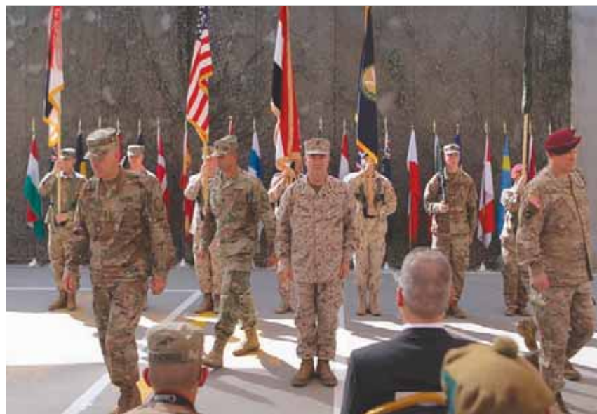
عناصر من الجيش الأميركي في قاعدة عسكرية في العراق

للعقوبات، فإن هذه الآلية لم تنجح حتى الآن بسبب عزوف معظم الشركات الكبرى عن استخدامها واستمرار انسحابها من إيران. وهو ما دفع بطهران لاتهام الأوروبيين في الأشهر الماضية بأنهم غير جادين في محاولاتهم لإنقاذ الاتفاق النووي.