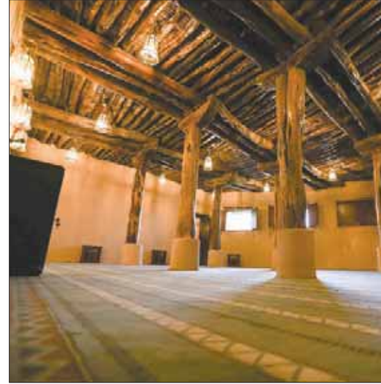
مسجد البجلي بن مالك الطائف (مكة المكرمة) بعد ترميمه