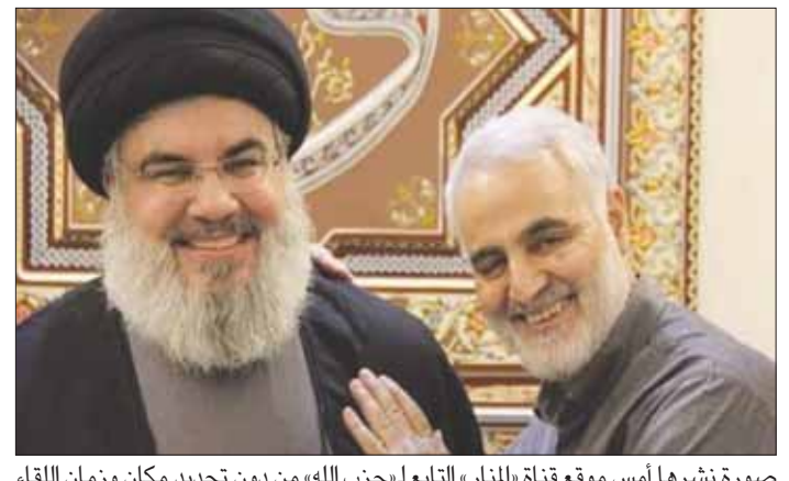
صورة نشرها أمس موقع قناة «المنار» التابع لحزب الله من دون تحديد مكان وزمان اللقاء