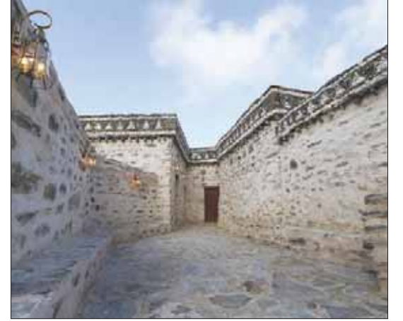
مسجد البجلي بن مالك (الطائف - مكة المكرمة) بعد ترميمه