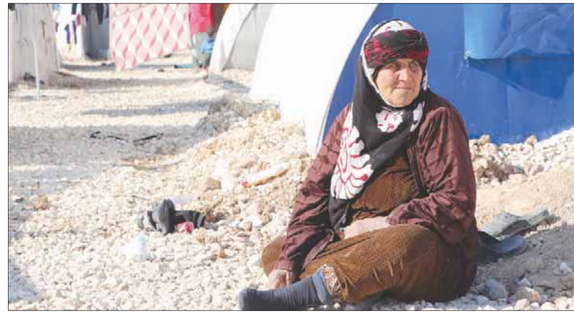
لاجئة هربت من معارك «نزع السلام» التركية إلى مخيم «واشوكاني» بالحسكة

أمراض وبائية معدية خاصة مع اشتداد موجات البرد والأمطار الشتوية، ولغفت قائلة: «تفتقنا أجهزة التدفئة والوقود والمواد الأساسية والأغطية والمساعدات الطبية، لسد الفجوة الصحية التي اتسعت مع زيادة أعداد النازحين». ونقل نازحو المخيم أنهم يواجهون أوضاعاً إنسانية صعبة في ظل غياب دعم الأمم المتحدة وخروج غالبية المنظمات الإنسانية الدولية من المنطقة، وانقطاع التيار الكهربائي ولا تغطي قلة ووقود التدفئة حاجات النازحين. ويبيح الدعم الذي تقدمه «الإدارة الذاتية لشمال وشرق» سوريا ومؤسساتها، محدوداً. ويعد المشفى الميداني التابع لـ«الهلال الأحمر الكردي» في المخيم، واحداً من المرافق الطبية الأكثر استقبالاً لمواجهة الأمراض. ويوفر خدمات الرعاية الصحية. وتقول المرضة المطبوعة لورين زيادة، إن أعداد المخيم تزايدت بسرعة فائقة، ما أدى إلى تقادم الأزمنة الطبية خصوصاً في الاستجابة للخدمات الإسعافية، فقد «أصيب الكثير من الأشخاص أثناء العمليات القتالية أو في