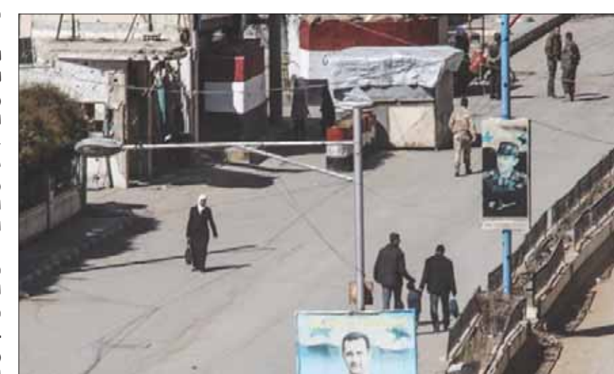
صورة أرشيفية لعناصر من قوات الأسد في جنوب دمشق

سراح المعتقلين من سجون النظام، وبحسب الموقع، انتشرت العبارات على جدران المدرسة الإعدادية والمدرسة الريفية، والبلدة. كما انتشرت عبارات مماثلة على جدران الأحياء والمدارس في بلدات دير ماجر والدنجة وكنّاكر وبيت جن وجديدة عرطون، في المنطقة الجنوبية من ريف دمشق الغربي.