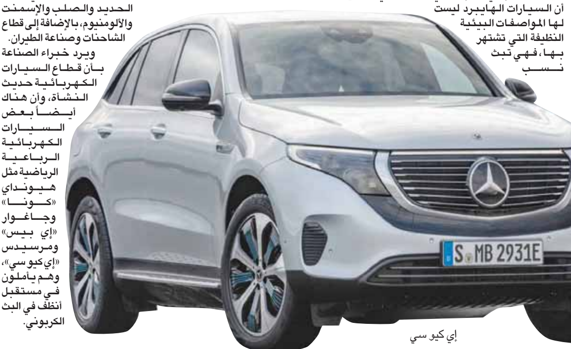
إي كيو سي

وفي بريطانيا، تشير الإحصاءات إلى بيع 1,8 مليون سيارة رياضية في السنوات الأربع الأخيرة. وخلال الفترة نفسها، لم تتخط مبيعات السيارات الكهربائية رقم 47 ألف سيارة، أي بمعدل سيارة واحدة لكل 37 سيارة رياضية.