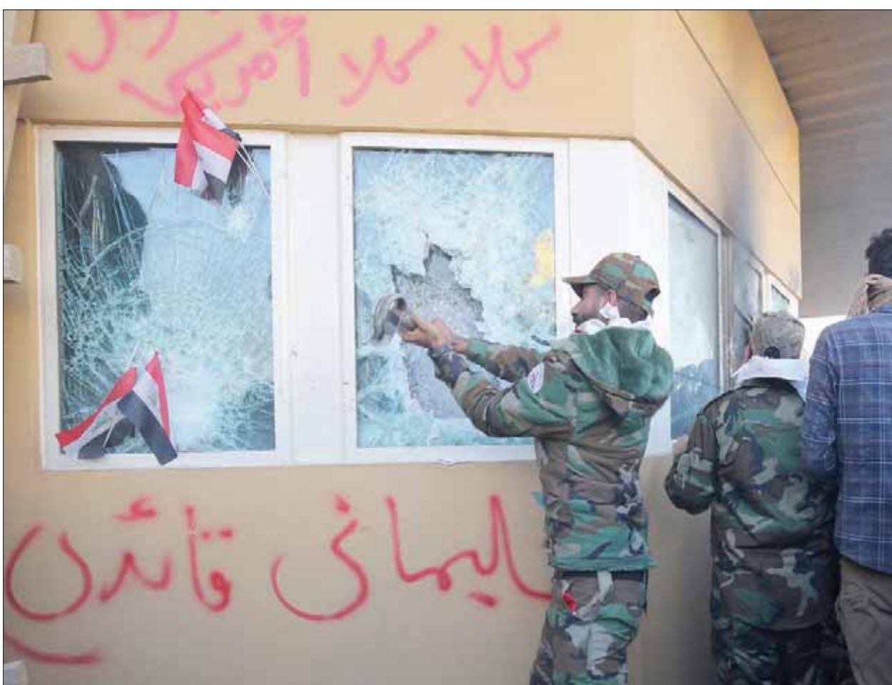
عناصر من «الحشد» يكتبون عبارة «سليمانى قاندى» في إشارة إلى الجنرال الإيراني قاسم سليمانى على جدار السفارة الأمريكية أمس (أ.ب)

ودعت السعودية إلى تضافر الجهود المخلصة كافة للمحافظة على أمن العراق واستقراره.