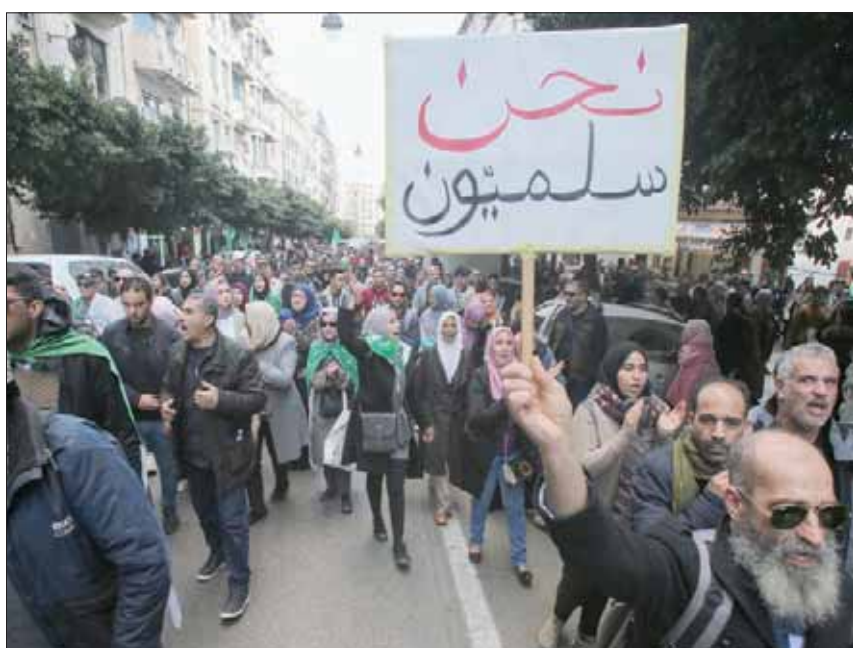
جانب من مظاهرات طلاب الجامعات أمس للمطالبة بالإفراج عن المعتقلين كشرط للهدنة مع السلطات

وعد مراقبون ذلك مؤشراً غير إيجابي من جانب السلطة الجديدة، ولا ينسج حسبه على أحداث الإفراج في الوضع، ولا على بدء حوار يقضي إلى حل للأزمة المستمرة منذ قرابة 11 شهراً.