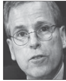
روبرت فورد *

بسبب صفقة الصواريخ الروسية «إس - 400»، وفي ظل عدم وجود أي مساعدة تركية في إنتاج المقاتلات من هذا الطراز، ويعد منع الشركات التركية من المشاركة في الإنتاج بمثابة ضربة كبيرة لجهود أنقرة لحشد صناعة دفاعية حديثة. كما نجحت أنقرة في مهمة سياسية مستحيلة في واشنطن، وهو توحيد الديمقراطيين والجمهوريين ضدها، حيث صوت الحزبان معا في الكونغرس للاعتراف بأن تركيا ارتكبت فعلاً من أعمال الإبادة الجماعية ضد الأرمن في 1915، وقد أراء أنصار الأرمن هذا القرار من الكونغرس على مدى عقود. لكن جماعات الضغط الديمقراطيون والرؤسي السديد، في الصف الماضي اعتقدت أن تركيا قد تقوم بالرذ. لكن أنقرة، في الواقع، لم تتخذ أي إجراءات ملموسة حيال الأمر، ذلك على الرغم من حصار بعض جنودها في نقطة للترقية في منطقة مورك جنوب غربي إلب. لكن علينا أن نكون واقعيين، فلا يمكن لأنقرة وحدها أن تنقذ إربل، ذلك في الوقت الذي تستغل فيه موسكو ودمشق عزلة تركيا.