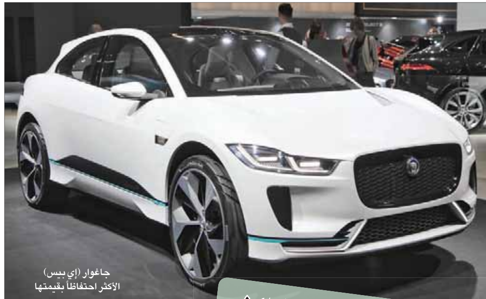
جاغوار (إي بيس) الأكثر احتفاظاً بقيمتها