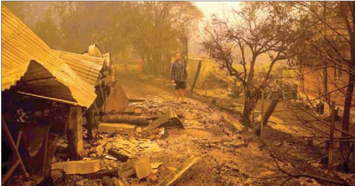
أسترالي يقف وسط الدمار بعد احتراق مدينة كوبراغو في نيو ساوث ويلز أمس

وغالبا ما تشهد أستراليا نشوب حرائق الغابات في الصيف، لكنها جاءت في وقت مبكر وعنف بسبب موجة جفاف. ويشير العلماء إلى عواقب الاحتباس الحراري. وبلغت الحرارة 47 درجة مئوية الاثنان في غرب أستراليا، فيما تجاوزت 40 درجة مئوية في