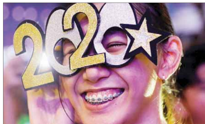
من احتفالات الفلبين