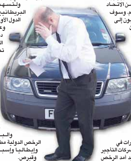
أولى هذه الوثائق هي الحصول على رخصة دولية، ويمكن الحصول عليها من مكاتب البريد البريطانية. وهي رخصة ضرورية أيضاً من أجل تاجير السيارات في أوروبا، حيث تطلب شركات التاجير نسخة منها. ولا يزيد أمد الرخص

ولتسهيل الأمر على البريطانيين، قررت بعض الدول الأوروبية التسامح، وعدم طلب رخص دولية منهم أثناء العطلات التي لا تتعد أكثر من 6 أشهر. من هذه الدول ألمانيا والنمسا وبلجيكا وبلغاريا والدانمرك وجمهورية التشيك واليونان وأيرلندا والمجر والبرتغال. ولكن الرخص الدولية مطلوبة في فرنسا وإيطاليا وإسبانيا وكرواتيا وقبرص.