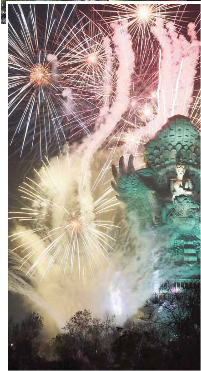
ألعاب نارية في بالي بإندونيسيا (إب.أ)

المرتبطة بالتغير المناخي إلى تجذعات في جميع أنحاء العالم، تلبية خصوصاً لدعوة الناشطة السويدية الشابة غريتا تونبرغ، وكسرت درجات الحرارة على مدى أشهر السنة الأرقام القياسية.