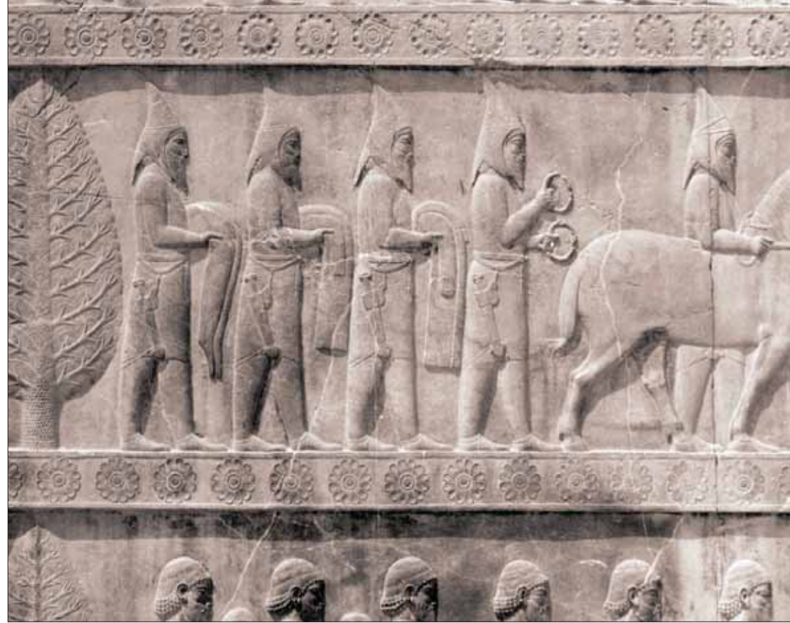
احتفال بابلي بالسنة الجديدة

ذوو الشفاه الباهتة \ الهاربون من الزمان إلى العدم». ولم يكن أدونيس في بداياته بعيداً عن ذلك فهو لا يتوانى في قصيدته «إلى حبيبتني في رأس السنة» عن الإعلان: «أنقل حبي لك من عام إلى عام \ كما ينقل التلميذ فروضه المدرسية إلى دفتر جديد \ أنقل صوتك، ورائحتك، ورسائلك، ورقم هاتفك وصندوق بريدك \ وأعلقها في خزانة العام الجديد \ وأستغنى إقامة دائمة في قلبك». أما الشاعر العراقي عدنان الصائغ فهو، خلافاً لنزار، وكل العبدن عن وطنهم، لا يرى في هذا البرزخ الزمني سوى مناسبة لتأكيد شعوره بالوحشة والنأي وسط جموع المحنطين في ساحات أوطانهم وكنف بيوتهم