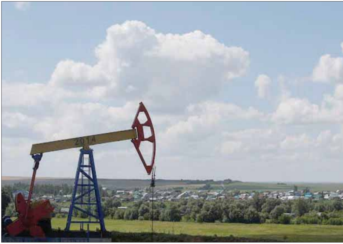
ارتفع سعر برنت 24% منذ بداية 2019 ليواصل تعافيه المتواضع بفضل خفض الإمدادات من «أوبك بلس»

ومن المتوقع أن يصل متوسط سعر خام غرب تكساس الوسيط الأمريكي 57,70 دولار للبرميل وفق «رويترز».