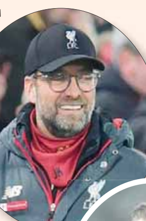
يورغن كلوب

وقال أنشيلوتي: «هل أننا مندسهن؛ لا، لأننا نبذل جهداً كبيراً في محاولة الفوز بالمباريات. شعرت بالدهشة من الروح الموجودة في الفريق؛ اعتقدت أن العمل الذي قام به دكان كان جيداً حقاً. وجدت لاعبين لديهم شخصية، ولذلك اعتقد أن هذا هو سبب عدم إجرائي لكثير من التغييرات... أظهر اللاعبون ثقة في المباريات، وأتمنى أن يستمر ذلك في المباريات المقبلة، وهي صعبة للغاية»، وتابع: «لا نمتلك وقتاً كافياً لمحاولة تغيير أشياء في المران، لأن هذا ليس هو الوقت المناسب. تغيير كثير من الأشياء قد يكون خطراً، لأن اللاعبين ربما يصابون بالارتباك. ولذلك، هدفنا القليل من التغييرات في هذه الفترة، والتركيز على المباريات». وقال أنشيلوتي إن أي حديث حول تدعيم فريقه في انتقالات يناير (كانون الثاني) سيكون بعد قمة مرسيسايد ضد ليفربول. ويغيب لاعب الوسط مورجان شنابرلين عن مواجهة سيتي، صاحب المركز الثالث، بسبب إصابة في ركلة الساق، لكنه قد يعود أمام ليفربول.