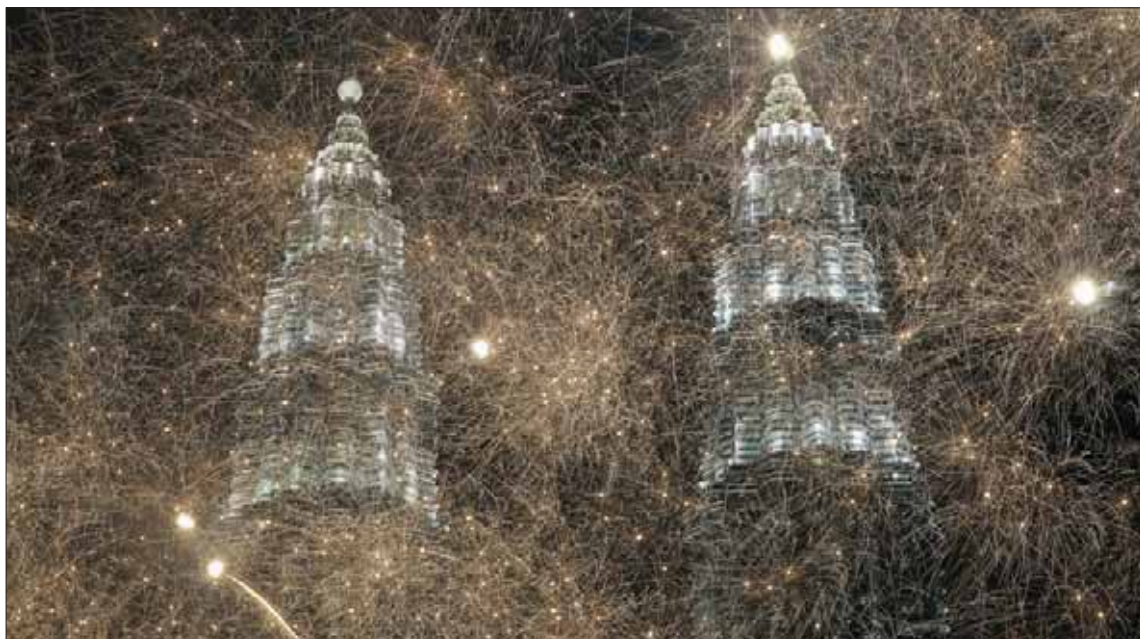
احتفالات كوالالمبور في ماليزيا

بمناسبة بداية العام القمري الجديد. ويذكر أن العام الجديد سيكون «عام الفأر» وفق التقويم الصيني.