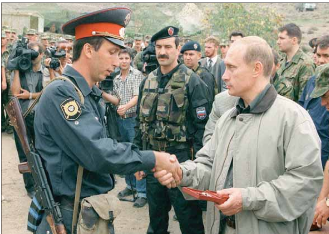
صورة أرشيفية لبوتين وهو يصافح شرطياً في قاعدة عسكرية بدافستان في أغسطس 1999

عملية الانتقال من الاتحاد السوفياتي إلى نظام جديد. وانتخب بوتين رئيساً بعد وقت قصير، مع توليه الرئاسة ثم رئاسة الوزراء بين 2008 و2012. ورغم استعداده موقع بلاده على الساحة الدولية وتأمينه شكلاً من الاستقرار فيها، فإن بوتين يهتمش كل الأصوات المنتقدة ولا يتوانى عن المواجهة مع الغرب.