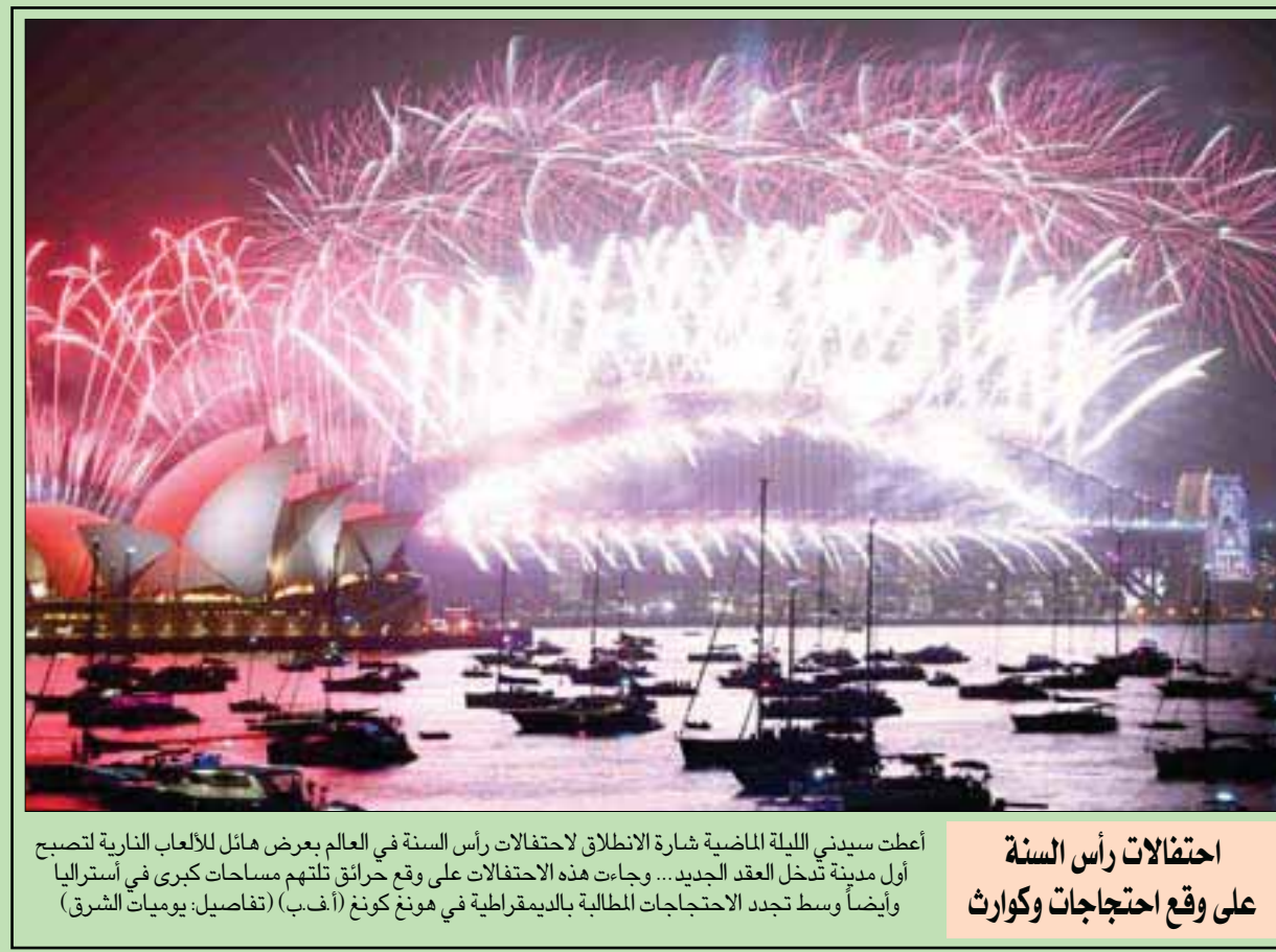
أعطت سيدني الليلة الماضية إشارة الانطلاق لاحتفالات رأس السنة في العالم بعرض هائل للألعاب النارية لتصبح أول مدينة تدخل العقد الجديد... وجاءت هذه الاحتفالات على وقع حرائق تلتهم مساحات كبرى في أستراليا وأيضاً وسط تجدد الاحتجاجات الطلابية بالديمقراطية في هونغ كونغ (أ.غ.ب) (تفاصيل: يوميات الشرق)

استخدمت روسيا القوة العسكرية والنفاذات مع أطراف أخرى لتعزيز «مكاسبها» في سوريا عام 2019، حيث أعادت إلى النظام نحو ثلثي مساحة سوريا ومخنته من بسط سيطرته على أكثر من 72 في المائة من مساحة البلاد البالغة 185 كيلومتراً مربعاً بعدما كانت نحو 10 في المائة في 2015. وأفاد «المرصد السوري لحقوق الإنسان» أمس، بأنه وثق في الشهر الـ11 من التدخل العسكري الروسي «مقتل 67 مدنياً بينهم 20 طفلاً، كما قتل 40 عنصراً من الفصائل