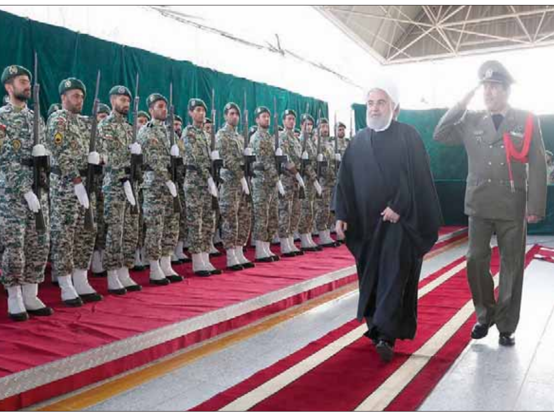
الرئيس الإيراني حسن روحاني لدى وصوله لتدشين مشروع في قطار الأنفاق غرب طهران أمس

ويعتقد محللون أن إيران ربما اضطرت لبيع الخام بخصم على المستويات الطبيعية مع سعيها لجذب المشترين القلقين من مخالفة العقوبات الأميركية. وقالت شركة «كبلر» لتتبع نقلات النفط في نوفمبر الماضي إن صادرات إيران تقلصت إلى 213 يوماً ما يجعلها بين الدول الأقل تصديراً للنفط. وقال روحاني: «العقوبات لكادت إيراداتنا مليار دولار أكثر في العام الماضي وهذا العام، ولو استفدنا من القروض الخارجية لنهاية هذا العام لكادت نحو مائة مليار دولار وفي المجموع تبلغ مائتي مليار دولار، لكننا الآن نفقد ذلك».