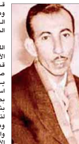
بدر شاكر السياب

ولكن أعقد أن ما يخلد الشعراء هو حجم النبوة في قصائدهم، وليس طاقة الجمال التصويري أو اللغوي وحدهما، فالشعر الذي يحمل رؤية تحرق الزمان وتعبه هو شعر خالد بالتجربة، ذلك أنه يستطيع أن يتكف مع أجيال قادمة، وهذا ما دأب عليه شعر السياب في (أنشودة المطر، وفي غريب على الخليج، وفي الموسم العمياء، وفي الأسلحة والأطفال، وفي مدينة بلا مطر، وفي أغنية في شهر أب، وفي عشرات النصوص). فمثلاً، يقول في «مدينة بلا مطر»: «وسار صغار بابل يحملون سلال صبار - وفاكهة من الفخار قرباناً لعشتار - ويشعل خاطف البرق - بظل من ظلال الماء والخضراء والنار - وجوهم الممطرة الصغيرة وهي تستسقي - ورف كأن ألف فراشة رفقت على الأبق - تشيدهم الصغير - قبور أختونا تنادينا - وتجتث عنك أدينا (...). ويختتمها: ولكن خفقة الأقدام والأيدي - وكركرة وأه صغيرة قبضت بيمانها - على قمر بربرف كالفرشة، أو على نجمة - على هبة من المعيم - على رعشات ماء قطرت همست بها نسمة - لتعلم أن بابل سوف تغسل من خطاياها».