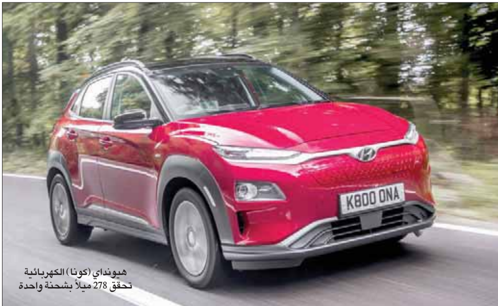
هيونداي (كونا) الكهربائية تحقق 278 ميلاً بشحنة واحدة