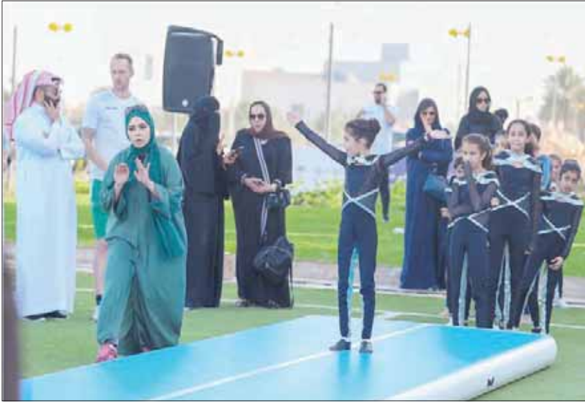
فتيات خلال أداء فقرة استعراضية للعبة الجمباز (الشرق الأوسط)

وقال البطل الأولمبي هاني النخعي بدوره: «أنا سعيد بهذه المشاركة وحالياً أوصل تدريباتي من أجل الاستعداد لأولمبياد طوكيو (العاصمة الحركية) وسأبدل كل ما يسوعي من أجل تكرار الإنجازات العالمية التي حققتها في منافسات سابقة ولدي الإصرار والعزيمة من خلال الدعم والإهتمام الذي تقدمه هيئة الرياضة وبتابعة مستمرة من الجهازين الفني والإداري».