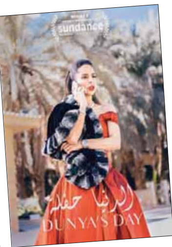
ملصق فيلم «الدنيا حفلة» للمخرج رائد السمري

وتحتضن السعودية في مطلع 2020 مهرجانات سينمائية عدة، على قائمتها مهرجان البحر الأحمر السينمائي الدولي، خلال الفترة من 12 حتى 21 مارس (آذار) 2020، في المنطقة التاريخية بمدينة جدة، إضافة إلى مهرجان الأفلام السعودية الذي تنظمه جمعية الثقافة والفنون في الدمام بالشراكة مع مركز الملك عبد العزيز الثقافي العالمي (إثراء). ويعد المهرجان أحد برامج المبادرة الوطنية لتطوير صناعة الأفلام السعودية التي أطلقتها الجمعية العربية السعودية للثقافة والفنون.