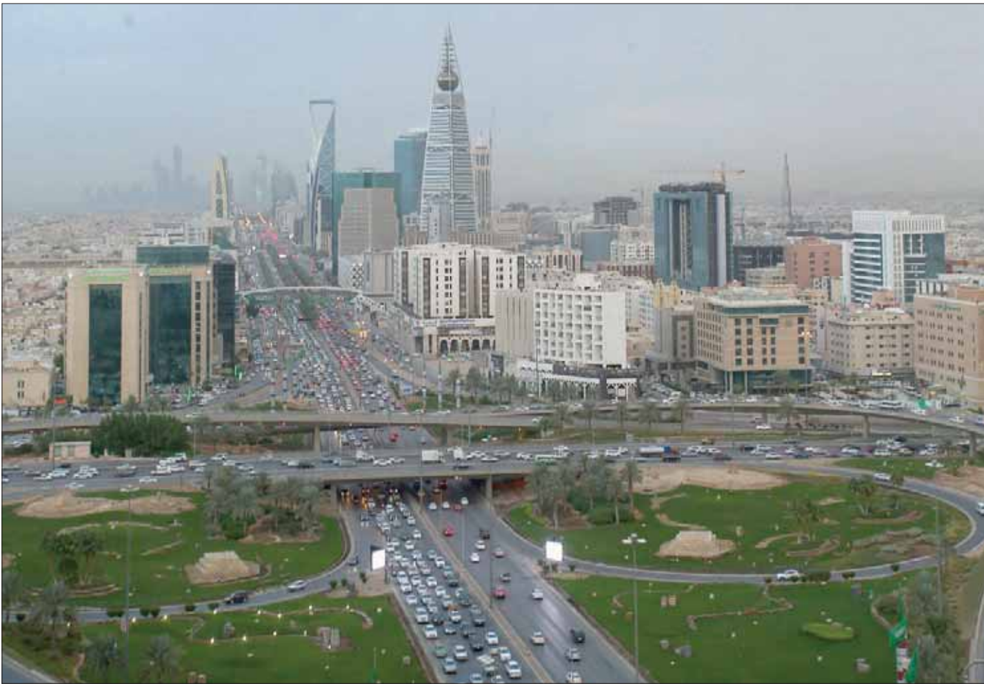
سجلت القروض السكنية نسبة نمو 254 في المائة في عددها خلال الفترة من يناير حتى نوفمبر من العام الماضي

ويبلغ مجموع الوحدات السكنية تحت الإنشاء التي تم حجزها من المستفيدين منذ بداية العام حتى أكتوبر (تشرين الأول) أكثر من 35 ألف وحدة سكنية، فيما تم تسليم عدد من المستفيدين أراضي مجانية بلغ مجموعها 81 قطعة أرض، وهو ما يعد رقم أكبر من مستهدفات العام، بواقع 50 ألف أرض مجانية، كما بلغ مجموع المستفيدين من خيار القرض العقاري المدعوم لشراء وحدة سكنية جاهزة في الفترة نفسها من العام الحالي 85,1 ألف مستفيد، إضافة إلى 46,9 ألف مستفيد من القرض العقاري المدعوم لخيار البناء الذاتي.