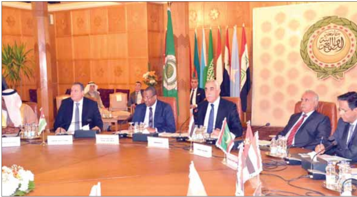
جانب من اجتماعات مجلس جامعة الدول العربية في القاهرة أمس

وذلك في إطار السعي نحو حل لبيبي خالص للأزمة، ورفع تقارير دورية لمجلس الجامعة ومتابعة تنفيذ هذا القرار.