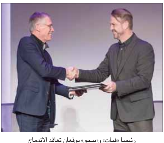
رئيسا «فيات» و«بيجو» يوقعان تعاقداً للاندماج

لطرزها الجديد «روما»، الأحدث بين خمسة نماذج جديدة أنتجتها خلال عام 2019. ويعتمد طراز «روما» على ناقل حركة جديد بثماني سرعات أخف وزناً من الناقل السابق، الذي يتكون من سبع سرعات فقط. كما تخلصت الشركة من كاتم الصوت المزوج الذي كان يحمله طراز