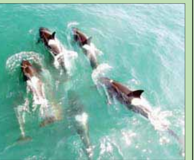
رصدت مجموعة من حيتان أوركا في مضيق ميسينا بإيطاليا مسجلة أطول طريق لهجرة الحيتان من هذا النوع 5200 كيلو متر