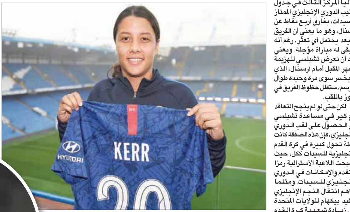
سام كير بقميص تشيلسي بعد انتقالها رسمياً إلى النادي اللندني

عندما تحصل لاعبة خط الوسط على الكرة وتكون لديها القدرة على التمرير بين الخطوط أو من فوق رؤوس المدافعات تظهر هنا خطورة كير. كما تعد كير أفضل لاعبة في العالم من حيث خطورة خلاف خط الدفاع واستغلال المساحات الخالية بسرعة عنها الفائقة. إنها تتحرك بشكل رائع وبنشاط كبير، وهو الأمر الذي يسبب إزعاجاً كبيراً لخطوط دفاع الفرق المنافسة، كما تمتاز بالقدرة على استغلال أنصاف الفرص أمام المرمى، حيث تجيد اللعب بكلتا قدميها، كما تمتاز بضرعات