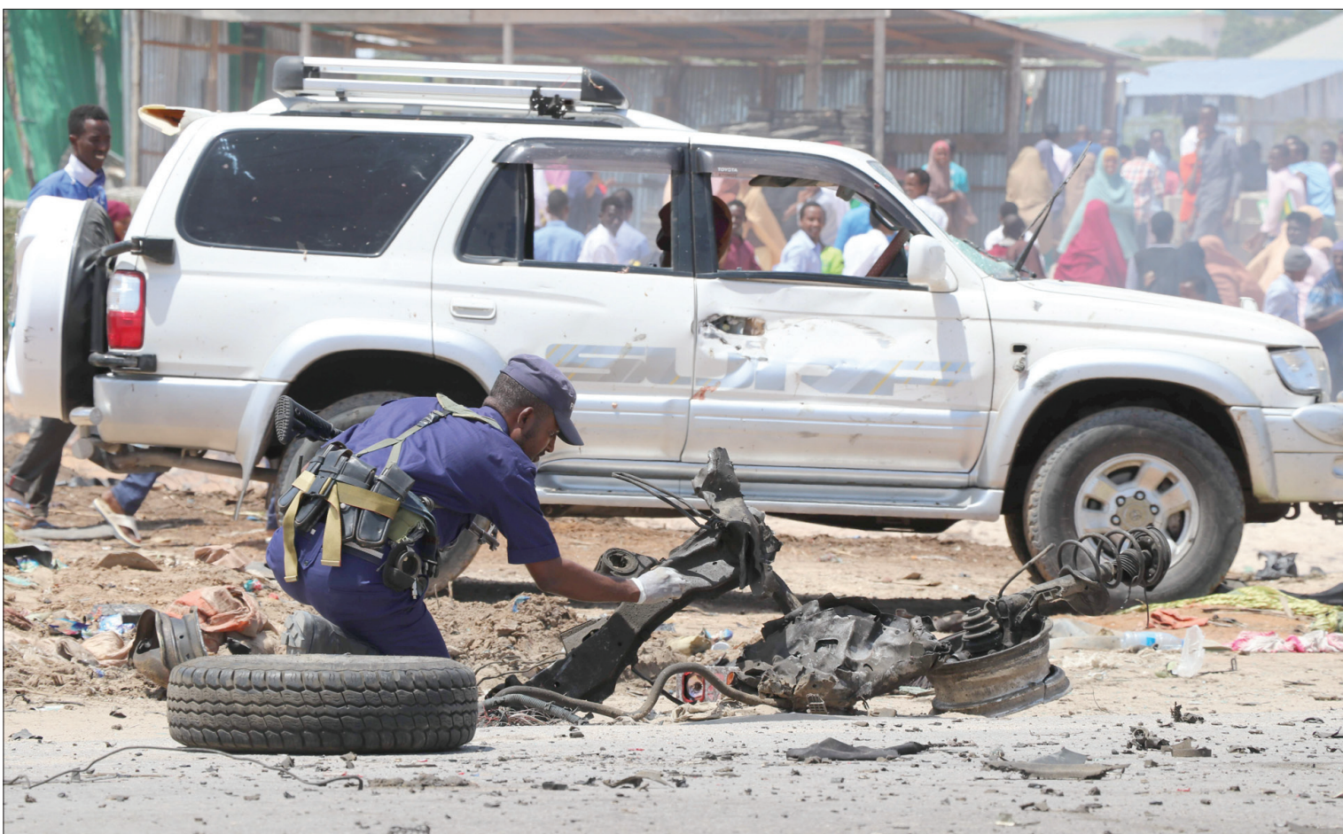
الشرطة الصومالية تجمع عينات من موقع هجوم انتحاري استهدف قافلة عسكرية تابعة للاتحاد الأوروبي في أكتوبر 2018 (أ.ف.ب)

أفريقيا، منها أوغندا. منذ انتهاء هجوم قوة حفظ السلام التابعة للاتحاد الأفريقي (أميسوم) في 2015، شهدت سيطرة الحركة على الأراضي ركوداً. وقال موتيجا إن أحد أكبر الأخطاء التي ارتكبت في القتال ضد «حركة الشباب» هو أنه غالباً ما تم طردهم من القرى دون «خطة قابلة للتطبيق لما سيحدث لاحقاً». ومع مغادرة نحو 20 ألف جندي من قوات حفظ السلام التابعة للاتحاد الأفريقي المقررة في 2021، يقول المحللون إن الجيش الوطني ليس جاهزاً على الإطلاق، ربما بسبب قيام بريطانيا وتركيا والاتحاد الأوروبي بتنظيم برامج تدريب منفصلة للجيش.