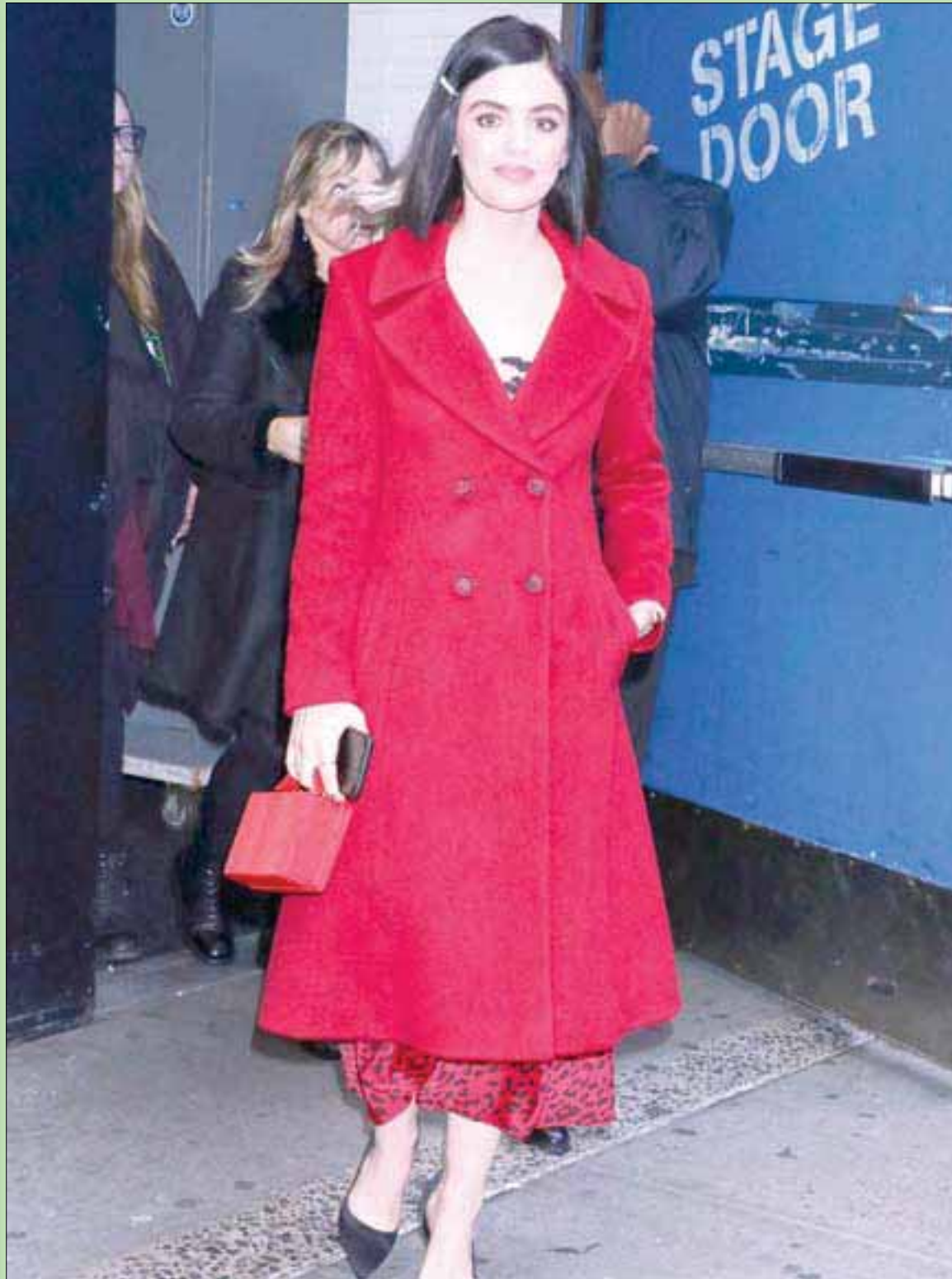
المثلة الأميركية لوسي هال في «تايمز سكوير» بنيويورك أمس

أما الدرس الحقيقي من كل هذه التطورات الأخيرة، فهو؛ حكام طهران وعصاباتهم العميلة في ديار العرب يفهمون الحوار ضعفاً... والقوة ردعاً حقيقياً.