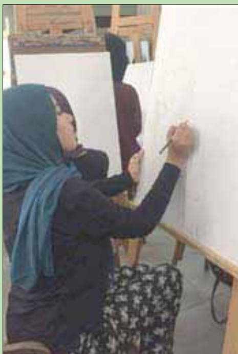
طالبة مصرية تعمل على تنفيذ مشروع فني