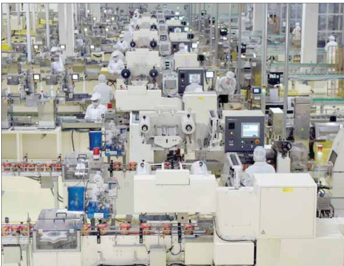
عمال في مصنع للمعكرونة في إقليم خنان بالصين

والرغبة بالبلاد هذا العام، ومن المتوقع أن يتجاوز معدل نمو واردات تجارة التجزئة الإلكترونية عبر الحدود في المائة. ومع صدور البيانات القوية، ذكرت الهيئة العليا للتخطيط الاقتصادي في الصين، أن نمو الاقتصاد الصيني سيطر مستقراً وقويًا بفضل الأسس الاقتصادية القوية والمرونة طويلة الأمد. وأوضح في بيان أن «النمو الذي حققه الناتج المحلي الإجمالي بنسبة ستة في المائة في الربع الثالث من هذا العام لم يكن على الإطلاق إشارة إلى فقدان الزخم، حيث إن النمو يتم تحقيقه على