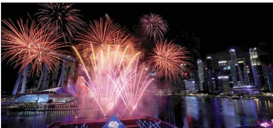
ألعاب نارية في سنغافورة

وللمرة الأولى منذ عشر سنوات، لم يجر إطلاق الألعاب النارية في سماء ميناء فيكتوريا الشهير في هونغ كونغ نظراً للاعتبارات الأمنية.