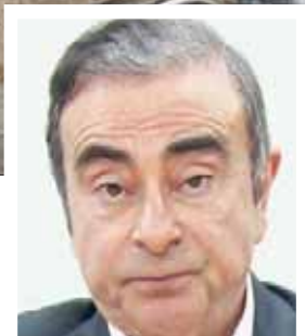
كارلوس غصن

وقالت مصادر لبنانية واسعة الاطلاع لـ«الشرق الأوسط» إن غصن، وأصدر غصن بياناً أمس أكد فيه انتقاله إلى بيروت هرباً من «قضاء ياباني متحيز» ضده، واعدة بالتواصل مع وسائل الإعلام في الأسابيع المقبلة.