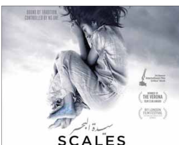
ملصق فيلم «سيدة البحر» للكاتبة والمخرجة شهد أمين

الدولي المتخصص بأفلام الأرت هاوس، وفاز بجائزة النقاد في مهرجان مراكش السينمائي الدولي.