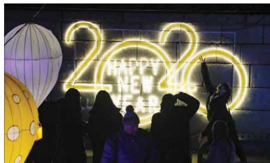
احتفالات سيول بكوريا الجنوبية