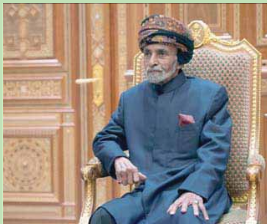
السلطان قابوس بن سعيد

يرتبط السلام والأمن في أفغانستان بالإعلان العالمي لحقوق الإنسان. إن عايننا طويلاً من الأضرار المترتبة على الصراع الأفغاني، نحن مواطنون أكثر من مليوني لاجئ أفغاني منذ ما يقرب من 4 عقود.