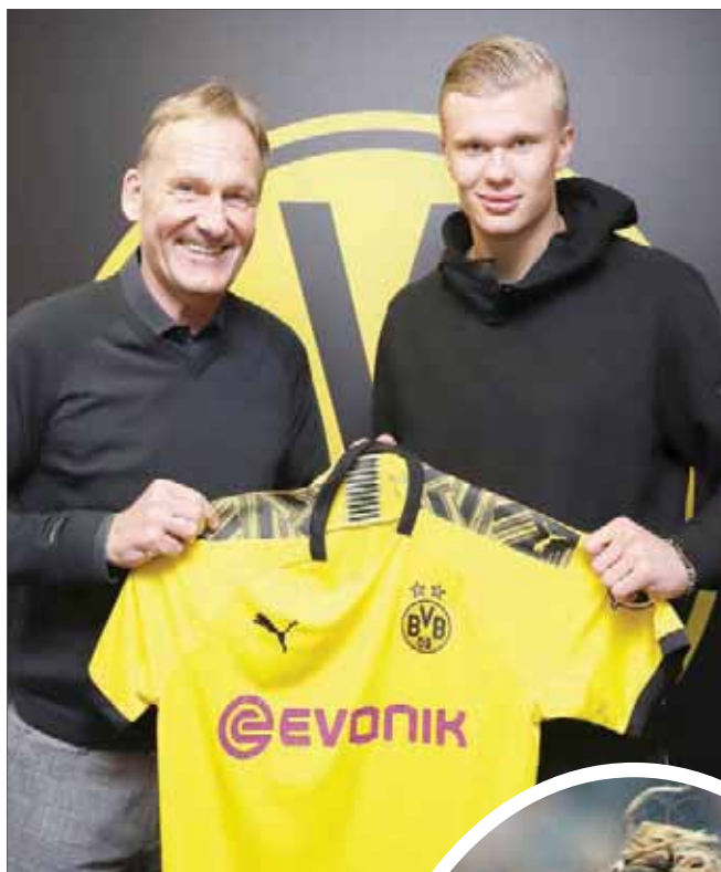
هالاند انتقل رسمياً إلى دورتموند الألماني (أ.ف.ب)

مع مهاجم بديل، وربما قلب دفاع. ويعد أن فشل في ضم النرويجي هالاند إلى صفوفه، يبحث مانشستر يونايتد عن مهاجم جديد، لعلماً بأن لاعب وسطه الفرنسي بول بوغبا حسم أمره بالبقاء في صفوف النادي، أقله حتى نهاية الموسم الحالي. أما مانشستر سيتي، حامل اللقب المحلي في الموسم الماضي، فهو في حاجة إلى قلب دفاع، ليسد الثغرة التي تركها غياب قلب الدفاع الفرنسي إيميريك لابورت.