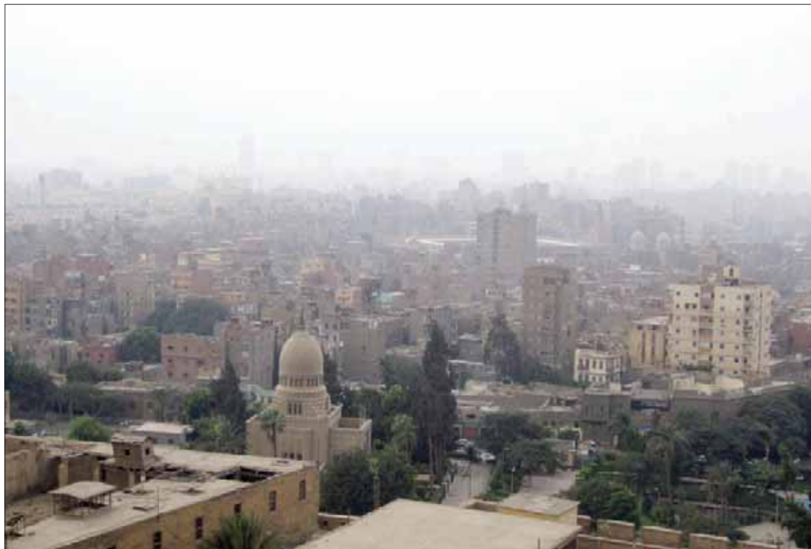
مصر تخطو خطوات ناجحة في نقل سكان المناطق العشوائية شديدة الخطورة إلى مناطق جديدة

تعد العشوائيات إحدى أهم مشكلات العمران والبناء في مصر، حيث تنتشر في جميع المحافظات وتشكل وفقاً للتقديرات الرسمية نحو 40% من مساحة العمران في البلاد، وتعد من نقص حاد في المرافق والخدمات، إضافة إلى ارتفاع الكثافة السكانية، وانتشار القمامة، والقبح في شكل المباني والطرق، وفي محاولة لوضع حد لهذه المشكلة وضعت الحكومة المصرية مخططاً لتجديد وتطوير المناطق العشوائية غير المخططة، وتحسين نمط الحياة بها، من المقرر الانتهاء منه بحلول عام 2030.