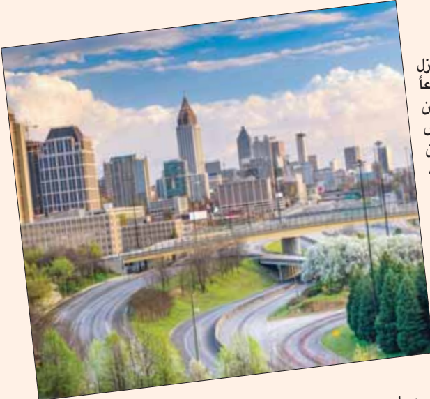
زاد حجم المنازل المناسبة لأسرة صغيرة الحجم خلال نوفمبر الماضي إلى 918 ألف وحدة في الولايات المتحدة وهو الأعلى منذ يوليو 2007

أسعار المنازل المتوسطة السعر في معظم أنحاء الولايات المتحدة. وتشير الإحصائيات إلى أن حجم المعروض الشهري من المنازل حتى نهاية نوفمبر بلغ 3,7 في المائة، وهو ما يقل عما كان عليه في الفترة نفسها من العام الماضي حين بلغ المعروض 4 في المائة.