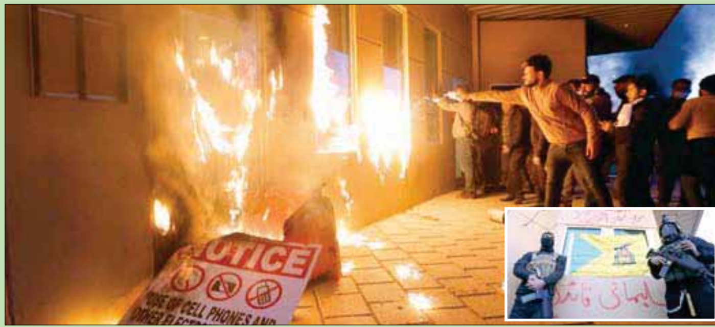
عناصر تابعة لـ«الحشد» تضرع النار في غرفة الاستقبال التابعة للسفارة الأميركية أمس (رويترز) وفي الإطار رجال أمن يقفان أمام كتابات للمهاجرين سموا قاسم سليمان «قائدهم» (رويترز)