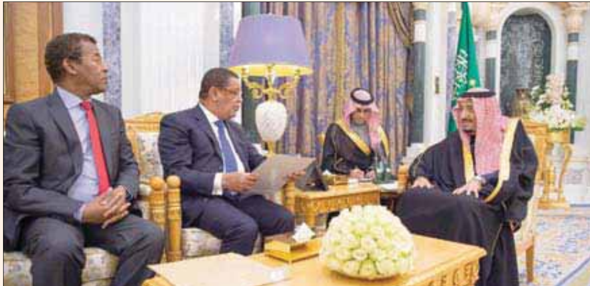
خادم الحرمين الشريفين يتسلم من الرئيس ملاتو تشومي رسالة القيادة الإثيوبية

ووافق المجلس على تعيين وترقيات للمرتبتين الخامسة عشرة والرابعة عشرة ووظفتي «سفير» و«رئيس مفوض». كذلك أطلع المجلس على عدد من الموضوعات العامة المدرجة على جدول أعماله، وقد أحاط المجلس علماً بما جاء فيها ووجه حيالها بما رآه.