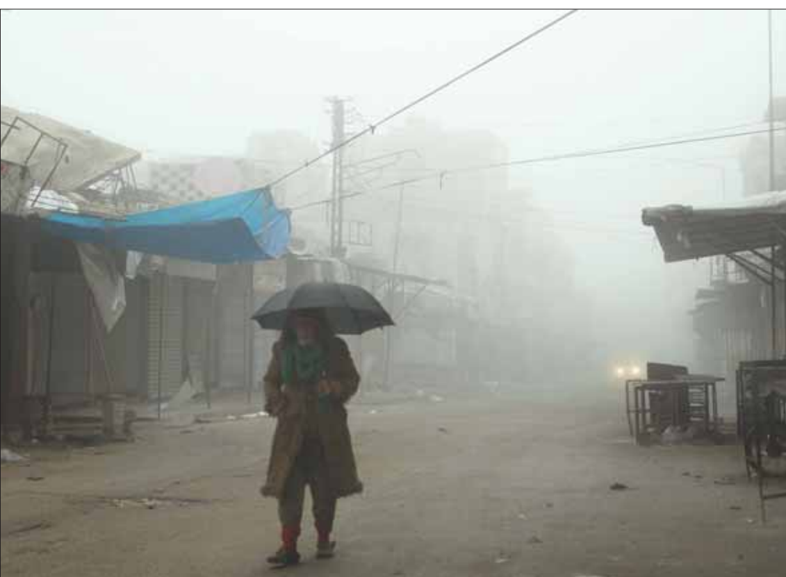
رجل مع مظلة في معرة النعمان الخالية من غالبية سكانها أمس

إلى ذلك، كشفت أوساط روسية جانباً من تفاصيل المحادثات التي أجراها في موسكو وفد تركي رفيع