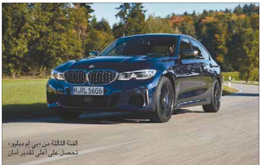
الفئة الثالثة من «بي إم دبليو» تحصل على أعلى تقدير أمان

تلندن، «الشرق الأوسط» أشارت إحصاءات أوروبية إلى أن معظم شركات السيارات رفعت من تقنيات الأمان في سياراتها خلال عام 2019 ولكن عشرة نماذج حققت التفوق في درجات الأمان بعد أن حصلت جميعها على خمس نجوم في اختبارات الأمان الأوروبية «يورو - إنكاب». وتشمل تقنيات الأمان الجديدة نظم كروز الفعالة ومراقبة حارات السير والمناطق العمياء على جوانب السيارات. وتراقب بعض السيارات سائقها لتحذيرهم من حالات التعب والإرهاق. على قمة اللائحة تأتي الفئة الثالثة من «بي إم دبليو» التي