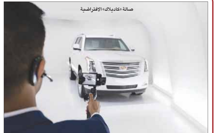
صالة «كاديلاك» الافتراضية

أطلقت شركة كاديلاك أول صالة عرض رقمية في الولايات المتحدة بحيث يستطيع المتسوق التعرف على سيارات الشركة إلكترونياً على الجوال أو الأجهزة اللوحية. الخدمة الجديدة اسمها «كاديلاك لايف» ويمكن من خلالها التواصل مع خبراء مختصين لاستكشاف مميزات عشرة نماذج من سيارات الشركة. وتوفر الخدمة وقت وجهد المتسوقين الذين يبدأون البحث عن سياراتهم الجديدة على الإنترنت. * وعد ستيف كارلايل، الرئيس التنفيذي لشركة كاديلاك، بالتحول إلى الدفع الكهربائي تدريجياً بحيث توفر الشركة 20 طرازاً كهربائية في عام 2023 والتحول الكامل إلى الدفع الكهربائي في عام 2030. كما أكد أن الشركة سوف تعود إلى أسماء السيارات كما كان الوضع في الماضي مع إلغاء استخدام الحروف المتبع حالياً. ووعد كارلايل بإنهاء ما أسماه «العصر الجليدي» للشركة. * حققت سيارة تايبانك الكهربائية من «بورشه» مدى 201 ميل في اختبارات أميركية رسمية، وهو إنجاز متوسط بالمقارنة مع السيارات الكهربائية الأخرى. ويقبل إنجاز تايبانك عما تحققه سيارات تسلا «موديل إس» من مدى يصل إلى 287 ميلاً، و«موديل 3» الذي يحقق مدى 220 ميلاً. وقالت مصادر من «بورشه» إن فكرة تايبانك تظل الجمع بين المدى والإنجاز المتفوق. * يدرس الاتحاد الأوروبي تقييد البحث الكربوني من السيارات لكي يقرب من الصفر في عام 2030. وينتظر الاتحاد تقريراً من لجنة متخصصة عن الانعكاسات الاقتصادية لهذا القرار قبل تطبيقه.