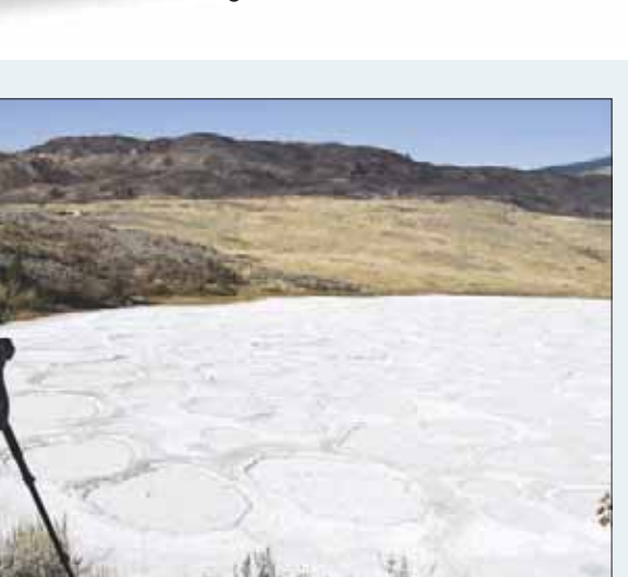
أحد الهواة يلتقط صوراً للبحيرة الغربية

شديد المعادن منها الكالسيوم وكبريتات الصوديوم والماغنسيوم في الماء. كانت هذه المعادن وكذلك مجموعة من الأملاح قد انتقلت إلى المنطقة من التلال المحيطة. ويعتمد لون البرك على تركيز المعادن بكل منها. وظلت ملكية الأرض المحيطة بالبحيرة