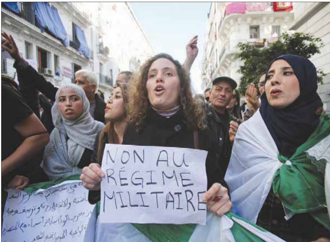
مظاهرات شارك في مسيرات العاصمة أسس حملات شعار «لا للنظام العسكري»

كل الرؤساء المتوفين، وقادة ثورة التحرير البارزين. وأوضح البيان أن «مراسم الاحترام التي تنقلها التلفاز، هي فرصة لتذكير الشعب بالثورة التي قادها الجيش الوطني، والتي قادها قادة الثورة الذين ضحوا بحياتهم من أجل الحرية والديمقراطية». وقال علي بن حاج، قيادي في الجبهة الإسلامية للإنقاذ، الذي قضى 12 سنة في السجن: «الحق أن قائد صالح فرض على الساحة السياسية خريطة طريق من داخل الكتلان، واتبع سياسة غير رشيدة ووفاته سحبت هزة عنيفة في الساحة العسكرية والسياسية في البلاد، وستكون لها ارتدادات، ونأمل أن تكون هناك مراجعات». ودعا بين حاج إلى أن «يواصل الحراك طريقه مع مراجعات في الشعارات والتكتيكات، وألا يبلتف لمن يريد أن يبطئه، وألا ينظر المظاهرات إلى الأشخاص، بل إلى المطالب التي تعود بالنفع على الشعب الجزائري، في دينه ودينه وهويته وتاريخه». وأعلنت رئاسة الجمهورية، في بيان، أمس، أن تشييع قائد صالح سيتم (اليوم) في مدينة بجاية، وهو مكان دفن فيه