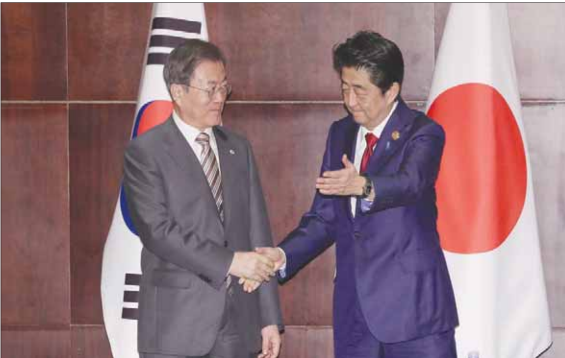
أبي ومون يتصافحان خلال لقاء ثنائي أمس في تشنغدو

بالانسحاب من اتفاق مهم لتشارك المعلومات الاستخباراتية، رغم أنها تراجعت عن ذلك في نوفمبر (تشرين الثاني) ووافقت على تمديد «بشروط».