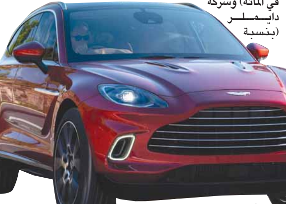
«استون مارتن دي بي إكس» الجديدة

سعر الأسهم المتدني حالياً من أجل استكمال الصفقة. ويملك ستروول فريق «ريسنغ بوينت» في سباقات «فورميولا 1» كما يتسابق ابنه لانس ستروول في المسابقات نفسها وتقدر قيمة ثروته بنحو 2,6 مليار دولار. وتملك أسهم استون مارتن حالياً مجموعات استثمارية من الكويت (بنسبة 36 في المائة) وإيطاليا (بنسبة 31 في المائة) وشركة دايمس (بنسبة 14 في المائة).