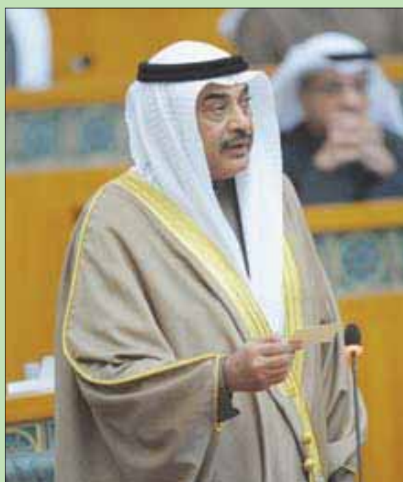
رئيس الوزراء الكويتي الشيخ صباح خالد الحمد الصباح لدى أداء حكومته اليمين الدستورية أمام مجلس الأمة أمس

أكد أن الحكومة أمامها مسؤولية مشتركة ومشروع وطني عنوانه التعاون من أجل ترجمة توجيهات أمير البلاد، مشدداً على أن «السلطة التنفيذية يقع عليها العبء الأكبر».