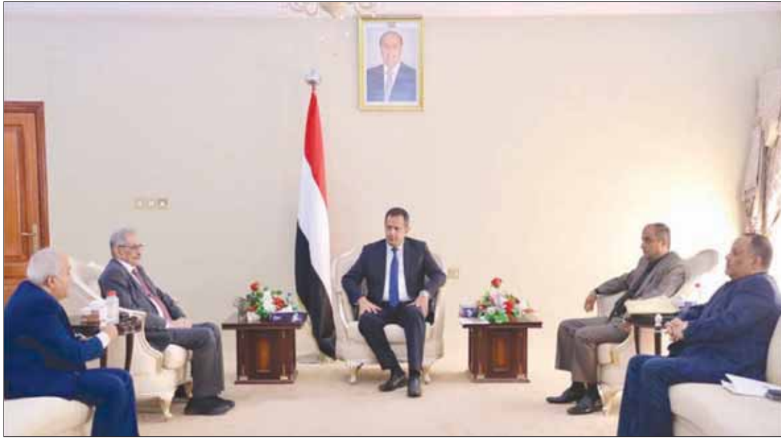
معين عبد الملك لدى اجتماعه مع قيادة وزارة المالية اليمنية والبنك المركزي اليمني في عدن

قوتها الشرائية وتحسين سعر الصرف واستقرار أسعار السلع الغذائية».