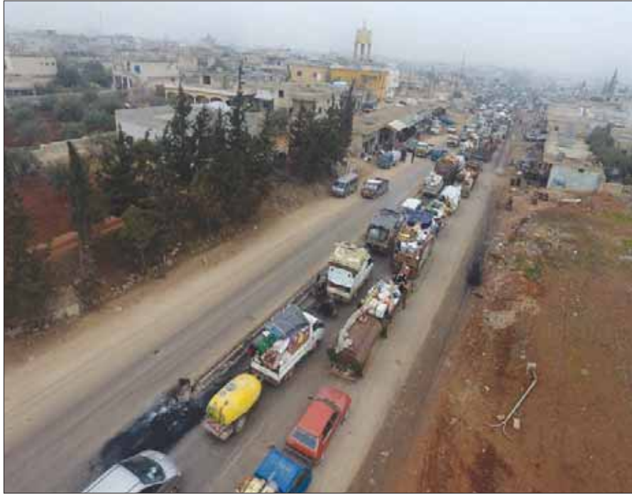
صورة عبر الدرون قرب الحدود التركية لقوافل نازحين هربوا من القصف الشديد

أنقرة: سعيد عبد الرازق قال المتحدث بإبراهيم كالبين، أمس (الثلاثاء)، إن روسيا ستعمل على وقف الهجمات في منطقة إدلب، شمال غربي سوريا، وذلك بعد محادثات مع وفد تركي في موسكو، مضيفاً أن بلاده تتوقع حدوث ذلك.