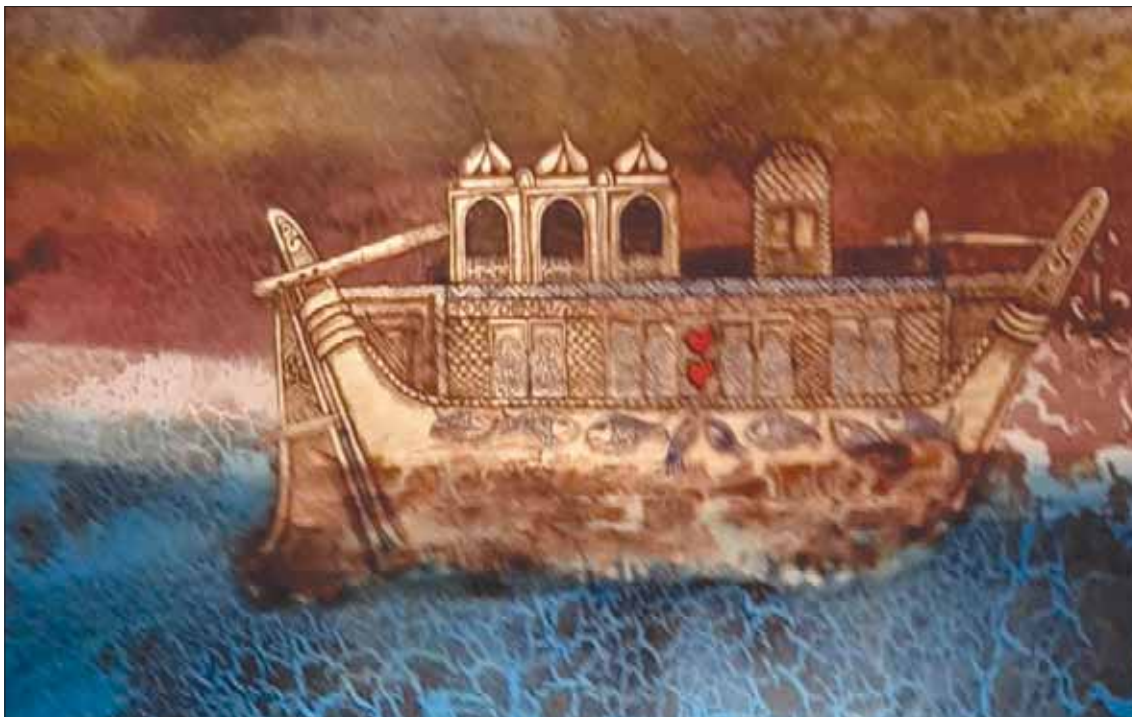
لوحات عبد الكريم تنطوي على بساطة مغوية والإشراق فيها كأنه ترحال في الزمن