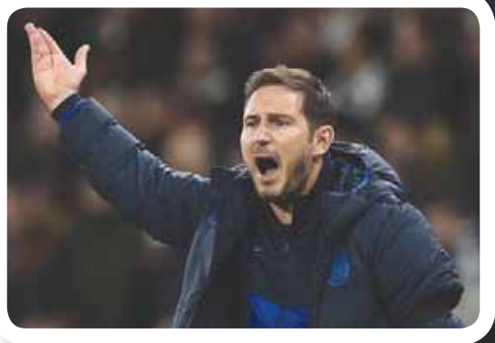
لامبارد مستاء من تصريحات مورينيو

وأشار رودجرز إلى أنه لا يفكر في الصراع على اللقب، وقال: «يوجد بالفعل فارق في النقاط يصعب تقليصه قياساً إلى عدد النقاط التي فقدتها ليفربول حتى الآن. لا يزال أمامنا الكثير لنصل إلى المستوى المنشود... لدي وجهة نظر فيما حققناه. نحترم ما وصلنا إليه. كنا نواجه مانشستر سيتي الذي يعد أحد أكبر الأندية. حينما يلعبون بهذا الأداء يصعب للغاية على أي فريق مجاراتهم». وأضاف: «تميز لاعبو ليستر سيتي بالبراعة. نحثل المركز الثاني وتأهلتنا للدور النهائي لكأس رابطة الأندية الإنجليزية. نندل دائماً قصارى