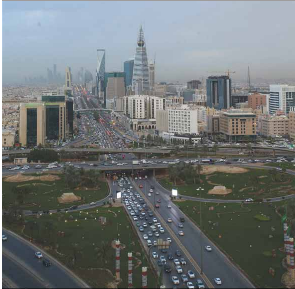
انخفض عدد الصفقات العقارية للأسبوع الثاني على التوالي بنحو 3,2% في السعودية

الرياض، عبد الإله الشديد الطبيعي، بعد سلسلة عنيفة من الارتفاعات.