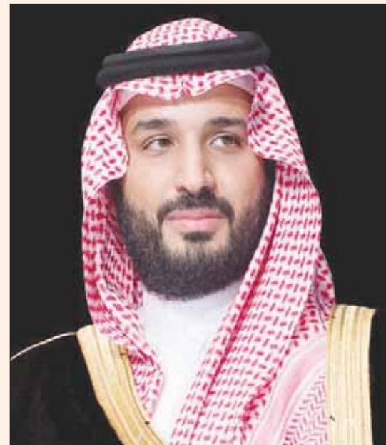
الرياض: «الشرق الأوسط»

يرعى الأمير محمد بن سلمان بن عبد العزيز ولي العهد نائب رئيس مجلس الوزراء وزير الدفاع، السبت المقبل، حفل سباق نادي الفروسية السنوي الكبير على «كأس ولي العهد لإيجاد الإنتاج والمستورد»، وذلك على ميدان الملك عبد العزيز بالجنادرية.