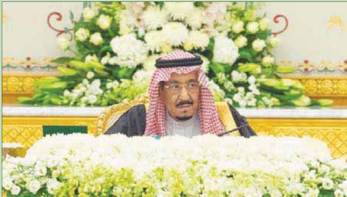
خادم الحرمين الشريفين لدى ترؤسه جلسة مجلس الوزراء (واس)