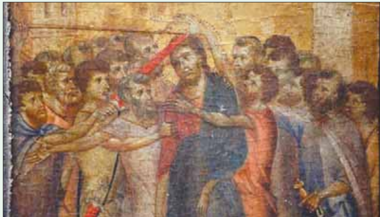
باريس، «الشرق الأوسط»

رغم عدم تأكيد هوية المشتري، تشير التقارير إلى أن اللوحة بيعت لصالح اثنين من جامعي أعمال فنية من تشيلي متخصصين في فن عصر النهضة الإيطالي، ويقعان في الولايات المتحدة الأميركية.