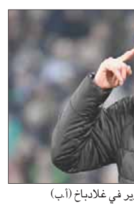
المدرّب روس يقود حملة تطوير في غلاباخ (أب)

ضمن صفوفه الحارس الدولي الأبرز مانويل نوير. وقال ماير: «هذه الخطوة قد تثير حالة من الاضطراب ولن تصب في مصلحة نويل. نوير يرتبط بعقد يستمر حتى عام 2021، وسبواصل اللعب على الأرجح لثلاثة أو أربعة أعوام مقبله، وبايرن ميونيخ لديه ما يكفي مركز حراسة المرمى، حيث يضم أيضاً سغن أولريش الذي شارك بديلاً لنوير في الكثير من المناسبات». وأوضح ماير المتوج مع المنتخب الألماني بلقب كأس العالم 1974: «سجدت اضطراب بلا شك، لا يمكنني تخيل أن نوير يرحب بذلك». وأضاف ماير أنه لا يفهم الدوافع وراء رغبة نويل في الانضمام لبايرن في ظل حقيقة أنه الحارس الأساسي لشالكة منذ عام، لكنه سيتواجد على مقاعد البدلاء في حال انضمامه إلى بايرن.