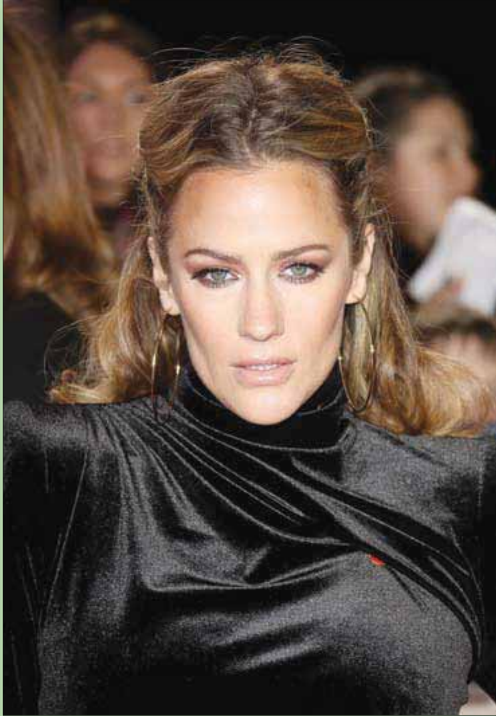
مقدمة البرامج البريطانية كارولين فلاك لدى وصولها إلى محكمة في لندن أمس بتهمته الاعتداء على لاعب التنس لويس بورتون

أوصلني إلى هذه المقدمة البديهية أنني اكتشفت محباً آخر للنهار والعشق النهرى. كنت أقرا وصية جواهر لال نهرو، مؤسس الهند المستقلة، فتوقفت طويلاً عند ارتباطه الوطني، ليس بارض الهند، وإنما بمباهاها. يقول نهرو في نثره الجميل وفكره العميق: «إن رغبتني في أن تُنشر كمشية من رمادي في نهر الغانج، عند مدينة الله آباد، لا علاقة لها إطلاقاً بأي مشاعر دينية. لقد توليت بنهر الغانج وجمته في منطقة الله آباد منذ كنت طفلاً، وكلما كبرت كان هذا الشعور يكبر معي. إن الغانج بصورة خاصة هو نهر الهند، بعشقه شعبيها وبحضن ذكرياتها وأمالها ومخاوفها وأغاني الانتصار والهزائم. إنه رمز الحضارة والثقافة، لا يكف عن التدفق والتحول ويبقى دائماً هو. إنه يذكرني بقمم الهماليا المغطاة بالثلوج وبأوديتها التي أحببتها كثيراً، وبالسهول الغنية بالرياح المنتشرة هناك، حيث عشت وعملت. لا أريد أن أقطع نفسي عن الماضي بشكل تام. فأنا فخور بذلك الإرث الذي كان ولا يزال، إرثنا جميعاً. وأدرك تماماً أنني أنا أيضاً واحد من الأفراد الذين يشكلون السلسلة المستمرة في تاريخ الهند الخالد. هذه السلسلة، لن أقطعها لأنني أعتقد جيداً وأعتبرها مصدر وحي لي. وكديل على هذه الرغبة وعلى تقديري لإرث الهند الثقافي، أقدم هذا الطلب بأن تُرعى حفنة من رمادي في نهر الغانج، عند الله آباد، بحيث يحملها المحيط من هناك ويغسل بها شواطئ الهند. أما القسم الأكبر من رمادي، فيجب رميه بطريقة أخرى. إنني أتمنى أن يُرعى هذا الرماد عالياً في الجو ثم يُرش من الطائرة فوق تلك الحقول التي يحرثها فأحلو الهند، بحيث يختلط بغير الهند وتربتها ويصبح جزءاً لا يميزه شيء عن سائر الهند.»