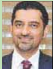
والبن ناصر المبارك

الأردني، زار أول من أمس، مقر اتحاد الكتاب والأدباء الأردنيين والتقى هيئته الإدارية، وقال الوزير، خلال اللقاء، إن «اتحاد الكتاب والأدباء من الهيئات الثقافية المهمة التي نعزّز بوجودها وبدورها في المشهد الثقافي الوطني، وتحرس أن يكون هذا الدور بناءً وقائدياً أيضاً، مضيفاً أن توجهات الوزارة والحكومة أن تدعم الثقافة، وأن تقف على مسافة واحدة من جميع الهيئات الثقافية بغض النظر عن الإدارة وعن أسلوب العمل».