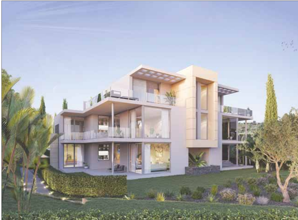
مجمع «مونت ري» يطرح فرصاً للمستثمرين الذين يتطلعون لشراء عقار كمشروع استثماري (الشرق الأوسط)

منطقة الغارف، حيث شهدت منطقة (الغارف) الريفية التي يقع مجمع مونت ري فيها، زيادة واحدة منها إرتفاعاً في الأطلسي والبحيرات والممرات المائية التي يضمها المنتجع، وتبدأ أسعار الفلل المفروشة بالكامل من 1,2 مليون يورو (1,32 مليون دولار)، في حين يصل سعر المساكن المؤلفة من غرفتين و3 غرف نوم التي تتميز بوجود مدخل خاص لها وبركة سباحة وصالة للياقة البدنية إلى