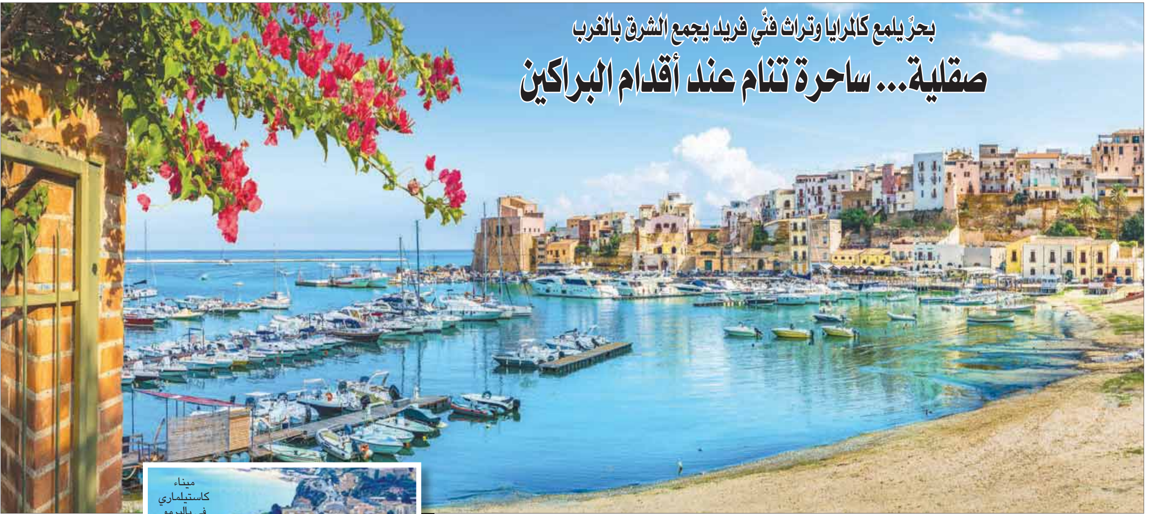
ميناء كاستيلماري في باليرمو

الحضارات وتركت بصماتها الفنية والثقافية في مبانيها وعاداتها ومطبخها، والتي يقال عنها إن «ما لا يعرف ماذا يحصل في باليرمو، لا يمكن أن يفهم ماذا يحصل في إيطاليا».