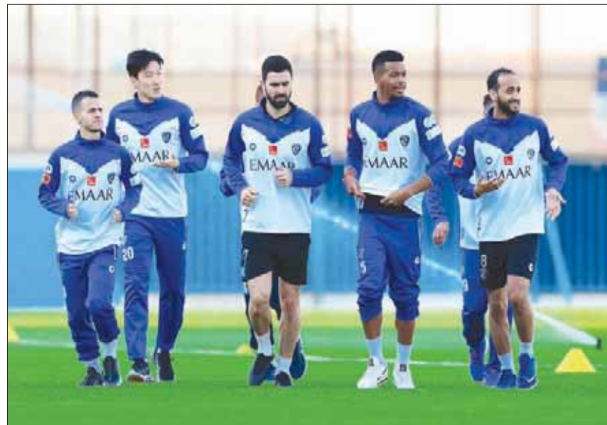
جانب من تدريبات الهلال استعداداً للحزم

بطلون بشدة بالفوز بالمباريات والبطولات، مثلهم مثل أي نادٍ أوروبي عظيم، إنهم دائماً يريدون الفوز». وأضاف: «الهلال لديه