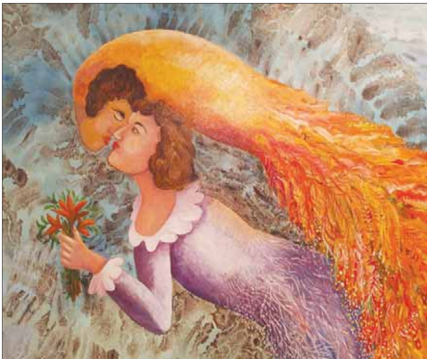
تتضافر الامتزاجات اللونية في لوحاته حارة دافئة بصيغتها الأرجوانية البنية والحمراء