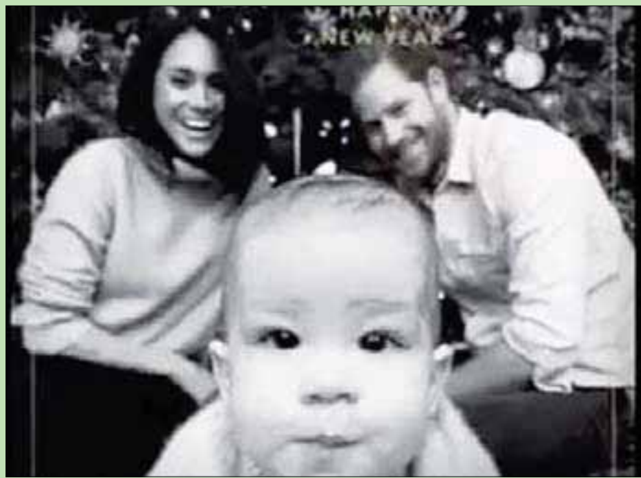
آرتشي نجل الأمير هاري وزوجته ميغان يتصدر بطاقة عيد الميلاد الخاصة بهما للسنة الحالية

المحتمل أن يكون قد أمضيا عيد الشكر في الولايات المتحدة مع والده ودوقة غلوريا راغلاند. وقد أعلن بالفعل عن أنهما لن ينضما إلى الملكة وللاعضاء الآخرين من العائلة المالكة في مزرعة ساندرينغهام الملكية في يوم عيد الميلاد، ويُقال إنّ الملكة تدعم خططهما، وهو القرار الذي يشبه القرار السابق لدوق ودوقة كامبريدج، حينما قررا قضاء عيد الميلاد مع والدي كيت وليس مع العائلة المالكة. وفي رسالتها السنوية وصفته بمناسبة عيد الميلاد، وصفت الملكة إليزابيث الثانية العام الحالي باعتباره «عاماً شاقاً»، كما تحدثت عن أهمية المصالحة، وقد اعتبر كلامها بمثابة إشارة إلى الاضطرابات السياسية والشخصية خلال الأشهر الـ12 الماضية. وقد ضوّرت الملكة أثناء رسالتها السنوية وهي تجلس