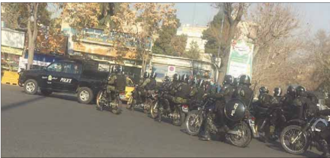
صورة تم تداولها على «تويتر» لانتشار القوات الخاصة في مناطق متفرقة من طهران