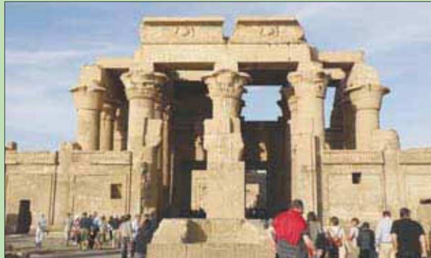
معبد كوم أمبو في أسوان يجتذب آلاف السياح سنوياً

تطوير منظومة الإضاءة بشكل كامل مع بدء الموسم السياحي المناسب مع مواعيد الزيارة المسائية للمعبد، كما تم وضع بعض الكتل الأثرية المتناثرة في المعبد على مصاطب في المنطقة المفتوحة بالمعبد، وربط دورات المياه بشبكة الصرف الصحي بدلاً من نظام البيارات القديمة، ويجري العمل حالياً مع الوحدة المحلية في كوم أمبو لتطوير الكورنيش والمرسى السياحي للمعبد. وكانت وزارة الآثار قد أعلنت الوزارة في مارس (آذار) الماضي، عن انتهاء تنفيذ مشروع خفض منسوب المياه الجوفية في المعبد بالتعاون مع الوكالة الأميركية للتنمية الدولية USAID، والهيئة القومية لمياه الشرب والصرف الصحي.