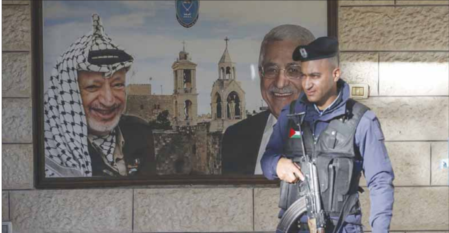
رجل أمن فلسطيني يحرس كنيسة القيامة وخلفه ملصق لصورتى الرئيسين الفلسطيني عباس وعرفات

كشفت مصادر سياسية في إسرائيل، عن أن رئيس الوزراء، بنيامين نتنياهو، قبل توصيات المستشارين القضائيين الذين نصحوه بوقف أي ممارسات أو إجراءات استيطانية توسعية، بما في ذلك الإعداد لتنفيذ الوعد الذي قطعه في حينه لضم منطقتي غور الأردن وشمال البحر الميت إلى تخوم السيادة الإسرائيلية. وقالت هذه المصادر، إن نتنياهو أمر بتجميد كل هذه الإجراءات وغيرها من أجل منع أي تصعيد ومواجهة في المحافل الدولية، والتركيز حالياً على مواجهة قرار المدعية العامة في المحكمة الجنائية الدولية في لاهاي، فاتو بنسودا، فتح تحقيق شامل في جرائم حرب نفذها الجيش الإسرائيلي في الأراضي الفلسطينية المحتلة. وبناءً عليه، ألغى مكتب نتنياهو الاجتماع الذي كان مقرراً لكبار المسؤولين في الوزارات المختلفة، أمس (الثلاثاء)، الذي كان من المقرر أن يبحث مخطط ضم الأغوار، ونقل الموقع عن مصادر مطلعة على القضية قولها إن «الضم سيدخل مرحلة التجميد العميق».