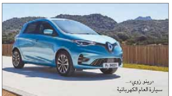
تلندن، «الشرق الأوسط»

إعفاءات ضريبية على ملكية وتشغيل السيارات الكهربائية التي لا تفوز أي عوادم كربونية. وتتفوق «رينو زوي» الجديدة بأنها توفر أطول مدى يصل إلى 245 ميلاً بشحنة كهربائية واحدة. كما أنها منخفضة الثمن وتتميز بتصميم داخلي جيد وتقنيات متفوقة. وفي القطاعات الكهربائية الأكبر حجماً فازت أيضاً سيارات كيا سول الكهربائية في القطاع المتوسط وجاغوار «أي بيس» في القطاع الكبير.