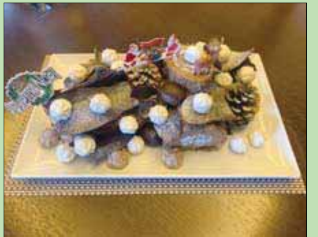
يمكن استخدام سكر القصب الخام في جميع الحلويات (الشرق الأوسط)

البسكويت جزء محبوب للغاية من عيد الميلاد، ولأحوائه على مقدار كبير من الدهون ودقيق القمح والسكر فلا ينتمي إلى فئة الأطعمة «الصحية». ولكن يقول الخبازون إنه يمكن الاستغناء عن بعض الأجزاء واللجوء لمكونات صحية من دون التضحية بالمذاق. ويمكن الاستغناء عن دقيق القمح واللجوء إلى دقيق الحنطة، على سبيل المثال. وهذا له تأثير بسيط على المذاق، ولكنّه يحتوي على قدر كبير من الألياف والمعادن. وبشكل مائل، يمكن