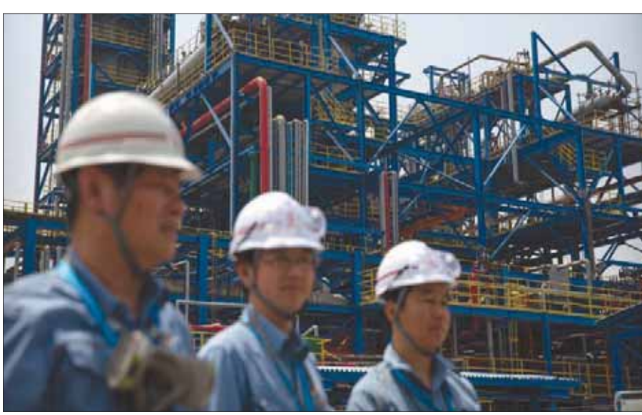
وعدت بكن بفتح أسواق النفط والاتصالات والطاقة للمنتج الخاص لتعزيز نمو اقتصادها المتباطئ

الخاصة، بما في ذلك تشجيعهم على أن يكونوا مدرجين في لوحة التكنولوجيا على غرار بورصة ناسداك الصينية في شنغهاي، ودعم مبيعات السندات ومقايضة الديون بالسهم، وتشجيع الشركات الخاصة على المشاركة في إعادة هيكلة المؤسسات المملوكة للدولة وبناء مجموعات المدن الضخمة. وكانت الصين قد وافقت على أول شركة إقليمية لإدارة الأصول، بحصة أغلبية تصل إلى 55 في المائة، لتأسيس شركة لإدارة الأصول في شنغهاي، واعتبرت بكن أن هذا الإجراء مهم لتنفيذ الانفتاح المالي في الصين وسيساعد في الاستفادة من الخبرات الدولية في تشغيل الأعمال وإدارة المخاطر.