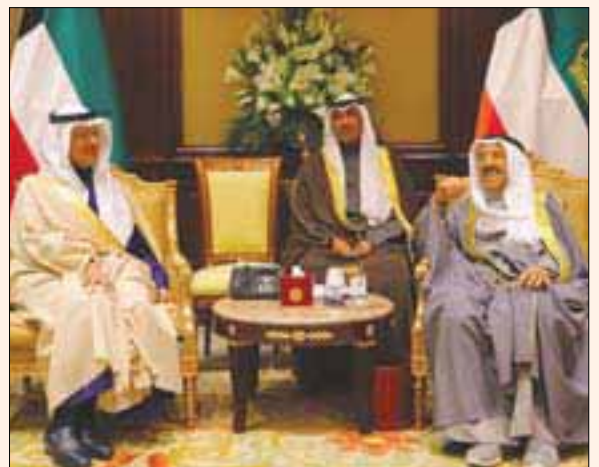
أمير دولة الكويت لدى لقائه وزير الطاقة السعودي أمس

نقل الأمير عبد العزيز بن سلمان بن عبد العزيز وزير الطاقة، تحيات وتقدير خادم الحرمين الشريفين الملك سلمان بن عبد العزيز، والأمير محمد بن سلمان ولي العهد، إلى الشيخ صباح الأحمد الجابر الصباح أمير دولة الكويت، وذلك لدى استقبال أمير الكويت في قصر بيان، أمس، وزير الطاقة السعودي.