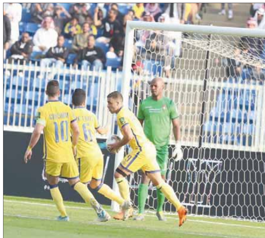
لاعبو النصر يحتفلون بتفوقهم على ضمك وبلوغهم دور ربع نهائي البطولة