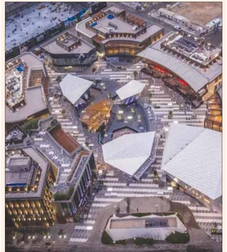
مشروع «اجدان ووك» في مدينة الخبر شرق السعودية