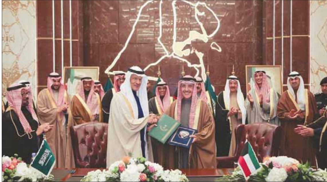
وزيرا الطاقة السعودي الأمير عبد العزيز بن سلمان والخارجية الكويتي أحمد ناصر الصباح خلال توقيع الاتفاقية أمس

وقعت السعودية والكويت، أمس (الثلاثاء)، مذكرة تفاهم تقضي باستئناف إنتاج النفط من حقلين مشتركين في المنطقة الحدودية، بعد نحو 5 سنوات من التوقف عن الإنتاج. كما وقع وزير الطاقة السعودي الأمير عبد العزيز بن سلمان بن عبد العزيز، ووزير الخارجية الكويتي الشيخ أحمد ناصر المحمد الصباح «اتفاقية ملحقه باتفاقية التقسيم واتفاقية المنطقة المغمورة المقسومة لاستئناف إنتاج البترول من الحقول المشتركة». ووقع الاتفاقية ومذكرة التفاهم، في مبنى وزارة الخارجية الكويتية، عن الجانب السعودي الأمير عبد العزيز بن سلمان بن عبد العزيز، وعن الجانب الكويتي وقع الاتفاقية الملحقه الشيخ الدكتور أحمد ناصر المحمد الصباح وزير الخارجية الكويتي، ووقع مذكرة التفاهم الدكتور خالد علي الفاضل وزير النفط وزير الكهرباء والماء الكويتي. وأكد الجانبان أن توقيع الاتفاقية الملحقه ومذكرة التفاهم «يعد تحسيدا للعلاقات الأخوية المتميزة والخاصة التي تجمع البلدين الشقيقين»، بقيادة الحرمين الشريفين الملك سلمان بن عبد العزيز، وأمير الكويت الشيخ صباح الأحمد الجابر الصباح، والتوجهات من لدنهما، ولدى ولي العهد السعودي الأمير محمد بن سلمان بن عبد العزيز، وولي عهد الكويت الشيخ نواف الأحمد الجابر الصباح. وأكد البلدان أن «هذا الإنجاز التاريخي قد تم عبر التعاون الكبير بين فريق العمل السياسية والفنية والقانونية من كلا الجانبين التي بذلت