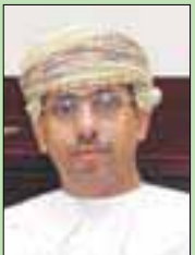
ع. د النعم بن منصور الحسني

الهيئة العامة للإذاعة والتلفزيون وجامعة السلطان قابوس. وقال الوزير: «نحن أمام حالة إعلامية غير مسبوقة يلزم أن نعمل الكثير كصناع قرار، واكاديميين، طلاب، وإعلاميين، بهدف التعرف على آين وصلنا في السلطة من هذا الإعلام على المستوى الفكري والتقني». أما عودة العضائية ووزير الدولة لشؤون الإعلام بالأردن، شارك أول من أمس، في الجلسة الافتتاحية للحلقة النقاشية التي نظمها مركز حماية حرية الصحافيين تحت عنوان «آليات دعم وسائل الإعلام لبيئة عمل مؤسسات المجتمع المدني»، وأكد الوزير حرص الحكومة على تعزيز مبدأ الافتتاح والشفافية مع المجتمع المدني، مضيفاً أن الحكومة منفتحة على ما يصدر من مختلف المؤسسات الأهلية، ومؤسسات المجتمع المدني من آراء وتوصيات موضوعية ومقترحات، يمكن أن تسهم في رفد جهود العمل الوطني.