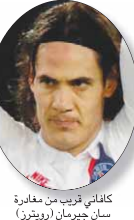
كافاني قريب من مغادرة سان جيرمان

للاستثمارات الرياضية، في العام 2013 وينتهي عقده بنهاية الموسم الحالي. وتابعت «ماركا»: «الصعوبة الوحيدة أمام الانتقال الوشيك هي النادي الفرنسي، والمبلغ الذي قد يطلبه، كافاني ليس سعداً بنسبة مائة في المائة في باريس»، لا سيما في ظل تراجع دوره بعد انضمام المهاجم الأرجنتيني ساورو إيكاردي إلى إينتر الإيطالي. بدورها، أفادت إذاعة «آر إم سي سبور» الفرنسية أن المهاجم توصل إلى اتفاق مع النادي الإسباني المتوج بلقب الدوري المحلي عام 2014، وأن ناديه الحالي يطل فرنسا في الموسمين الماضيين «منفتح على فكرة السماح لكافاني بالرحيل هذا الشتاء».