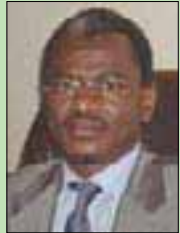
سيدى ولد سالم

الدكتور عبد الله أشور، وزير الثقافة والحيوانات والحياة البرية السوداني، التقى أول من أمس، السفير حسام عيسى، سفير مصر لدى السودان، حيث سبل تعزيز التعاون الثقافي بين البلدين، وأبرز الوزير السوداني أهمية العمل الجغرافي بين مصر والسودان بما يحقق المصلحة المشتركة والتكامل الحقيقي بينهما، مشيراً إلى أن تشهد الفترة المقبلة تفعيل جميع المشروعات المشتركة بما يخدم شعبي البلدين.