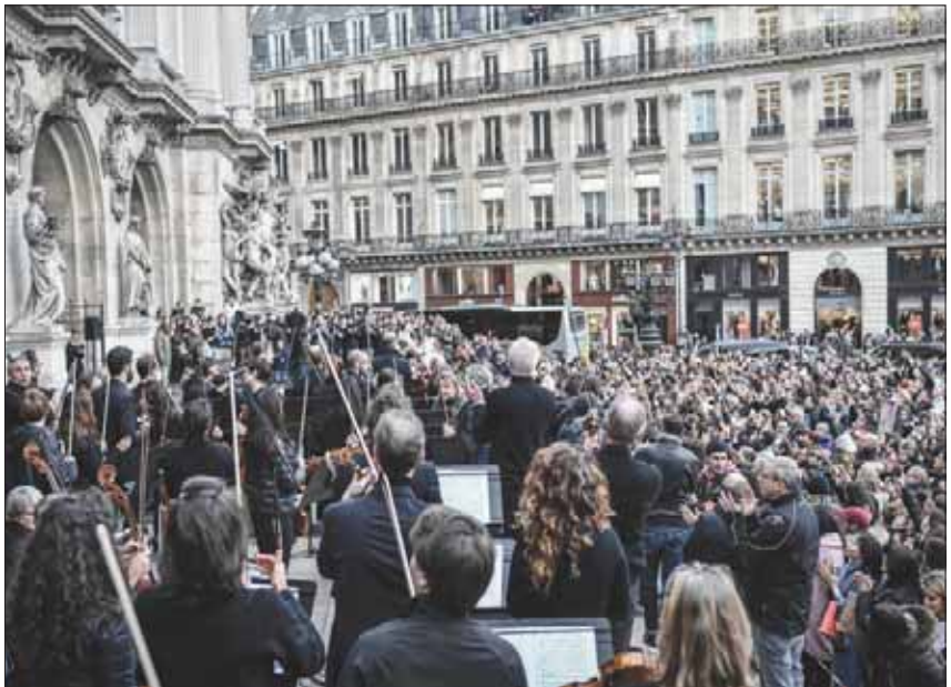
موسيقيون يشاركون في المظاهرات ضد سياسات الحكومة في باريس أمس

مكافحة الشغب، وتخلّلت شرطة سيدي» مساء أمس، هاتفين بشعارات. وتساعد الموقف حين شاهد المتظاهرون عناصر من الشرطة ترتدي الزي المدني، وتجمع مئات النشطاء مرتدين ملابس سوداء في «هاربر