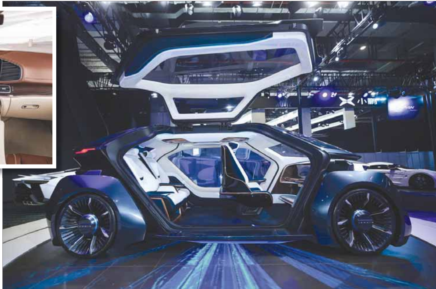
سيارات المستقبل تحمل تقنيات أمان وتواصل

* نظام آخر لمراقبة السائق: وتقدمه شركة سوبارو في سياراتها، وهو نظام يتعرف على وجه السائق ويراقب حركة الوجه عبر كاميرا في لوحة القيادة. وينبه النظام السائق صوتياً في حالات النعاس، كما يقوم النظام بتعديل وضعية المقاعد والمقود والمرايا وفق تفضيل السائق. والجديد في النظام هو التعرف على وجه السائق. * نظام التواصل بين السيارات: وتحمّل هذا النظام سيارات فولكسفاغن غولف من الجيل الثامن التي تصل في العام