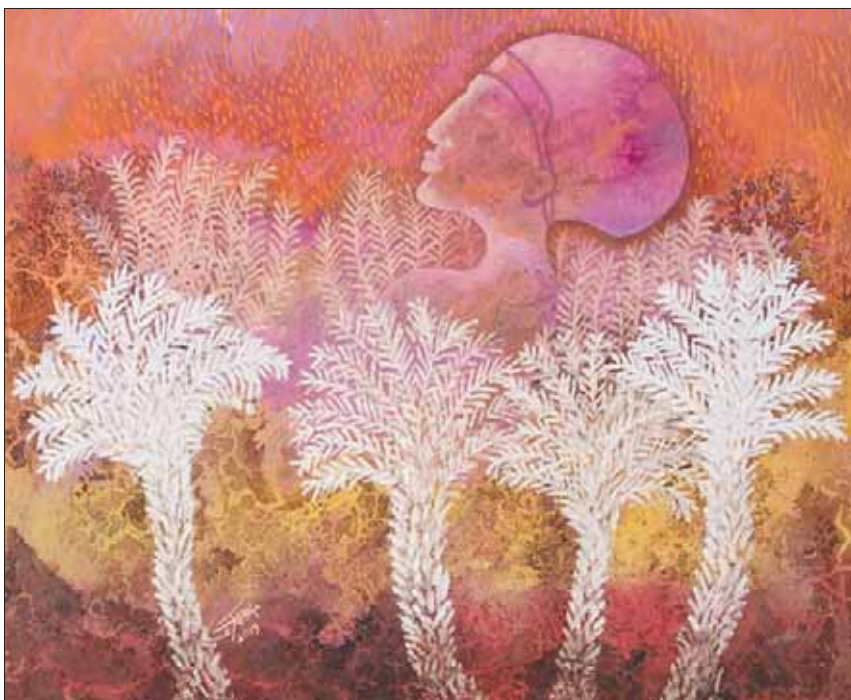
لوحاته مولعة بالتناغم البصري مع الطبيعة واللعب على تيمات من الموروث الشعبي