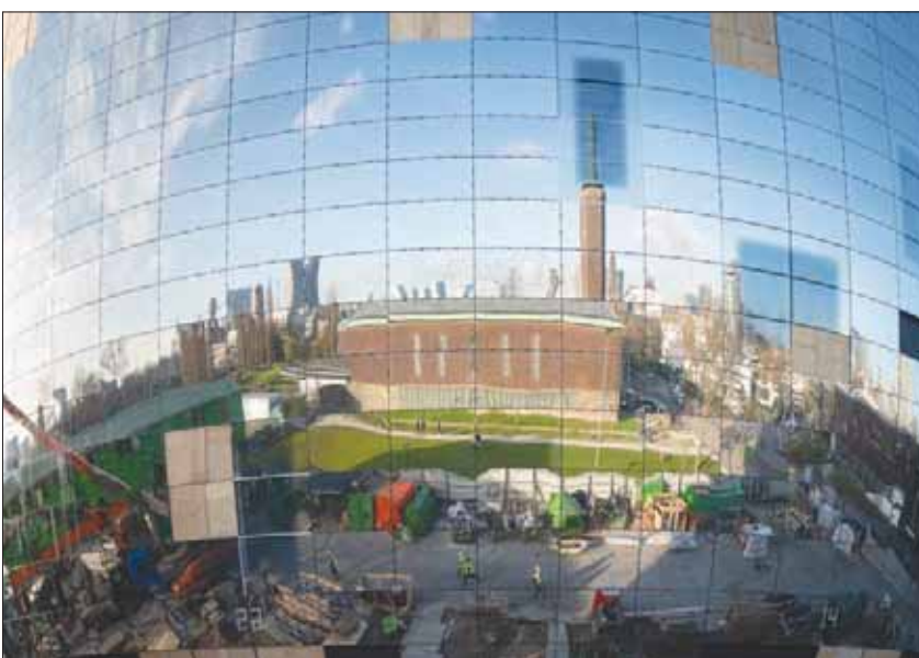
روتterdam، نيتا سيفال*

وقف شاريل إكس في الطابق السفلي من متحف «بوجيمانز فان يونينجن»، وقد غطت المياه الجوفية كاحل قدمه، في صورة قريبة الشبه من مشهد فيلم «خيار صوفي».