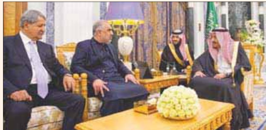
خادم الحرمين الشريفين لدى لقائه رئيس «الجمعية الوطنية» في باكستان