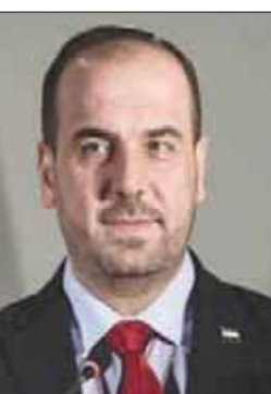
نصر الحريري رئيس «هيئة التفاوض السورية»

وأضاف، أنه رغم كل حماية المدنيين والدفاع عنهم، ويضيف إليه عجزاً جديداً يطال المفاوضات السورية، أن الجولة السورية. وينبغي على الجميع أن يستنق كل قواه من أجل إدخال المساعدات الإنسانية إلى هذه المناطق».