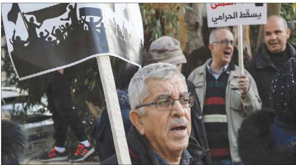
محتجون أمام قصر العدل في بيروت أمس

بيروت، الشرق الأوسط قال وزير المالية في حكومة تصريف الأعمال علي حسن خليل إنه «غير المقبول ما يحصل في بعض المصارف حيث تحبس معاشات الموظفين التي تحولها وزارة المالية شهرياً وهي حق مقدس»، وحذّر في أول تعليق له على الإجراءات التي ترفضها لإعتصام عدد من اللبنانيين في بيروت، رفضاً للإجراءات السياسية المالية التي يعتمدها كما ادعى إلى وقف دفع الضرائب والرسوم. وبعده من «تجمع طلاب لبنان» اعتصم عشرات الطلاب أمام مصرف لبنان في الحرير، أمس، منددين بالسياسة المالية الاقتصادية المتبعة، ووقع إشكال بينهم وبين القوى الأمنية عند محاولتهم إقفال الطريق. وأكد المعتصمون «رفضهم لدفع الضرائب»، مطالبين بـ«ضريبة على الأرباح والتأمين ووزعوا على السيارات لمصقات حملت شعار (مش دافعين) ودعوا اللبنانيين إلى الامتناع عن دفع الضرائب والرسوم والتوقف عن تسديد القروض المصرفية المستحقة إلى حين استرجاع الحقوق، بحسب ما ذكرت الوكالة الوطنية للإعلام».