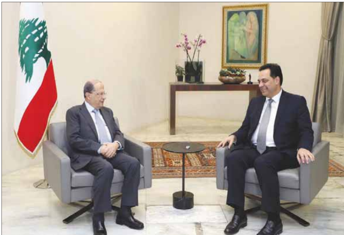
الرئيس اللبناني ميشال عون مستقبلاً رئيس الوزراء المكلف حسان دياب (اليمين ونهرا)

بيروت، ناشر عباس يرسم رئيس الحكومة اللبنانية المستقبل سعد الحريري معالم «المرحلة المفتوحة» مع عهد الرئيس ميشال عون، ويشكل أوضح مع صهره وزير الخارجية جبران باسيل، الذي جزم الحريري بأنه «لن يتعاون معه مطلقاً بعد اليوم... إن لم يعتدل». وبدا واضحاً من خلال كلام الحريري، الذي أتى في درشة مع عدد من الصحفيين في دارته، وسقط بيروت، أمس، أنه فتح النار بقوة على العهد، وباسيل تحديداً، في مقابل حرصه الواضح على التهدئة مع «الثنائي الشيعي» أي حركة أمل و«حزب الله» من منطلق رفض الفتنة السنية - الشيعية، التي بدأ الحريري واضحاً في تمسكه بالابتعاد عنها ما أمكن، في مقابل حرب مفتوحة على باسيل الذي اتهمه مباشرة بالسعي للسيطرة على البلد، من دون أن يحدد رئيس الجمهورية العماد ميشال عون، معتبراً أن فريق الرئيس «يتعامل مع الدستور والقانون على أنه وجهة نظر». الحريري الذي قال إن موقفه النهائي مما يجري سيتبلور مع بداية العام الجديد، أوضح أنه بصدد دراسة عميقة للواقع القائم، وسيكون له موقف واضح مما يجري لاحقاً، راسماً علامات استفهام كبيرة حول الوضع