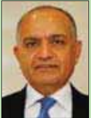
أمجد عودة العضائية

الهيئة العامة للإذاعة والتلفزيون وجامعة السلطان قابوس. وقال الوزير: «نحن أمام حالة إعلامية غير مسبوقة يلزم أن نعمل الكثير كصناع قرار، واكاديميين، طلاب، وإعلاميين، بهدف التعرف على آين وصلنا في السلطة من هذا الإعلام على المستوى الفكري والتقني». أما عودة العضائية ووزير الدولة لشؤون الإعلام بالأردن، شارك أول من أمس، في الجلسة الافتتاحية للحلقة النقاشية التي نظمها مركز حماية حرية الصحافيين تحت عنوان «آليات دعم وسائل الإعلام لبيئة عمل مؤسسات المجتمع المدني»، وأكد الوزير حرص الحكومة على تعزيز مبدأ الافتتاح والشفافية مع المجتمع المدني، مضيفاً أن الحكومة منفتحة على ما يصدر من مختلف المؤسسات الأهلية، ومؤسسات المجتمع المدني من آراء وتوصيات موضوعية ومقترحات، يمكن أن تسهم في رفد جهود العمل الوطني.