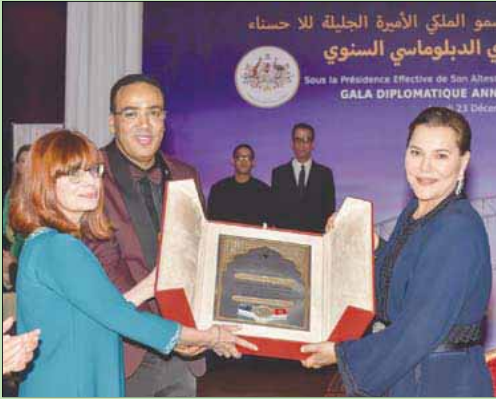
الأميرة للا حسناء تتسلم درع المؤسسة الدبلوماسية من سفيرة أستراليا لدى الرباط

سفارة أستراليا في المغرب عام 2017 «الأولى في أفريقيا الفرنكوفونية»، ساهم في تجاوز عائق المسافة المتعقبة في 20 ألف كيلومتر التي تفصل أستراليا عن المغرب، مشيرة في هذا الصدد، إلى أنه رغم هذه المسافة «تتقاسم نفس القيم المتمثلة في التضامن، والتفاني، والتعاون في خدمة الأشخاص الأكثر فقراً». من جانبه، قال رئيس المؤسسة الدبلوماسية عبد العاطي الحالك إن جل ريع هذا الحفل الخيري الدبلوماسي سيخصص لفائدة دار الأطفال للا حسناء، كي تتمكن جمعية الإحسان، التي تعتبر الأميرة للا حسناء رئيستها الشرفية، من مواجهة مصاريف هذه الدار ضماناً لاستمرار خدماتها الإنسانية.