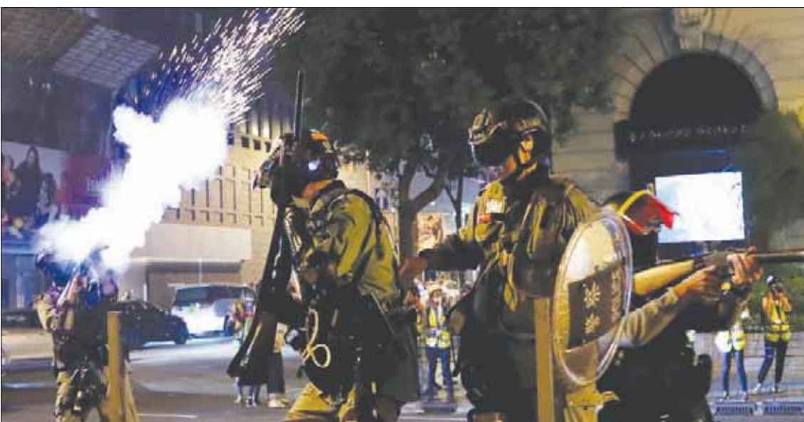
قوات مكافحة الشغب تطلق الغاز المسيل للدموع لتفريق المتظاهرين بهونغ كونغ أمس

مكافحة الشغب، واستهدف أحد رجال الشرطة المتظاهرين ببندقية ومد تجار لإغلاق محالهم. كما وقعت حوادث مماثلة في ثلاثة مواقع أخرى على الأقل في تحويل شوارع معيقة إلى مناطق