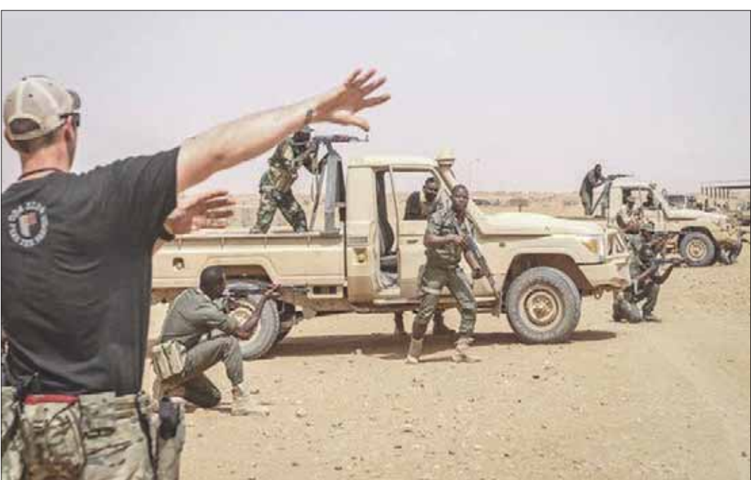
تدريبات بين قوات أميركية ونيجرية ضمن خطط التصدي للإرهاب في الساحل الأفريقي

قتلى إثر كمين تعرضوا له قبل عامين أثناء القيام بدورية راقية في النيجر. وتساءل فريق إسبر مشككين في القيمة الحقيقية المكتسبة من وراء مواصلة بذل تلك الجهود مع رغبتهم في تقليص المهام العسكرية الخارجية المعنية بمواجهة الجماعات المتطرفة المسلحة التي تفقر تماماً إلى القدرة الواضحة والنية الكاملة لشن الهجمات على الولايات المتحدة في أراضيها. وتشير التقارير إلى أن كل الجماعات الإرهابية العاملة في غرب أفريقيا لا تتسق مع معايير التقييم الصارمة المذكورة.