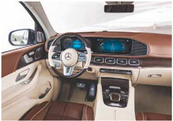
تطبيقات الهاتف الجوال متاحة في سيارات «مرسيدس»

المقبّل. ويسمى النظام «كار تو إكس» ويتواصل مع السيارات الأخرى المماثلة في نطاق 800 متر من السيارة. ويشارك النظام في معلومات المرور ويحذر السيارات الأخرى من عواقب على الطريق. * نظام المساعدة الشخصية: وتقدمه أيضاً شركة فولكسفاغن في سيارات أرتون التي تصل في العام المقبل. ويمكن للنظام أن يوقف السيارة بأمان باستخدام نظام كروز الذكي في حالات الطوارئ مثل إغماء السائق أو مرضه المفاجئ. ويحاول النظام أيضاً إفاقة السائق عبر الكبح المفاجئ وهزات المقود والتنبه الصوتي قبل تولى قيادة السيارة لقطعة أمانة للتوقف.