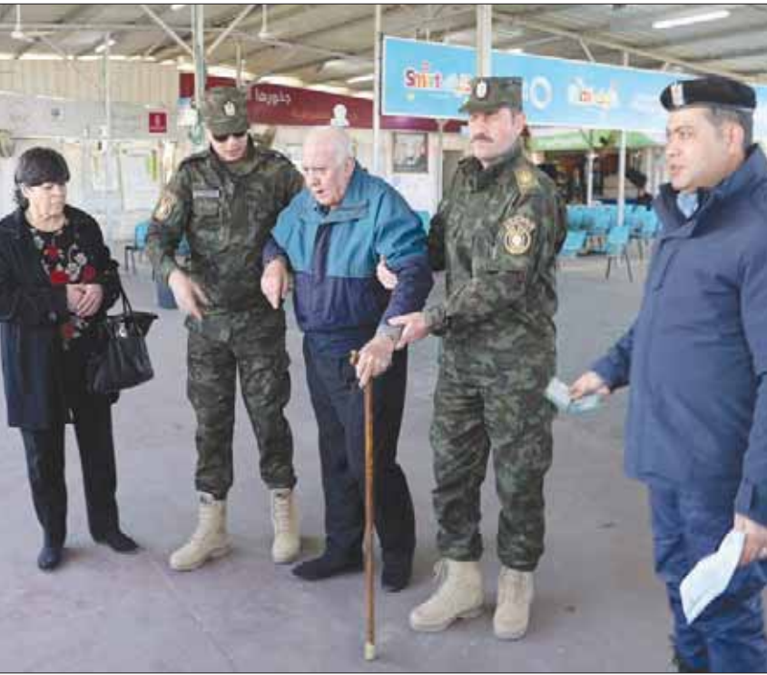
مسيحي من غزة يجتاز معبر إريز بمساعدة الشرطة الفلسطينية متجهاً لبيت لحم (رويترز)

غزة، الشرق الأوسط قال بعض مسيحيي غزة ومسؤولون فلسطينيون، أمس (الثلاثاء)، إن أقل من نصف المسيحيين المقيمين في القطاع الذين طلبوا تصاريح إسرائيلية لزيارة المواقع المقدسة في بيت لحم والقدس في عيد الميلاد، حصلوا على موافقة على طلباتهم. وقالت إسرائيل يوم الأحد إنها ستسمح بسفر المسيحيين من قطاع غزة، الذي تفرض عليه حصاراً، متراجعة عما أعلنته في 12 ديسمبر (كانون الأول) بشأن منعهم لسدواح أمنية، وهو ما يخالف سياستها المعتادة في عيد الميلاد. وعشية عيد الميلاد، قال مسؤولو حدود فلسطينيون إن 316 تصريحاً صدرت لمسيحيين للسفر من غزة إلى القدس وبيت لحم في الضفة الغربية المحتلة. وقال رجال دين مسيحيون إنهم طلبوا 800 تصريح، بحسب وكالة (رويترز) للأخبار.