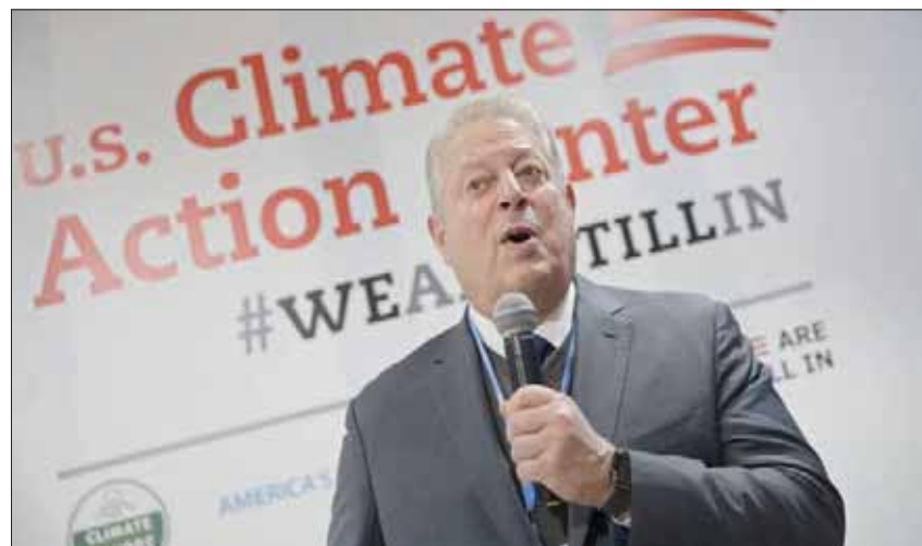
آل غور لدى حضوره قمة مدريد للمناخ

التحذير الأخير في هذه القصة من مخاطر الكارثة البيئية جاء أمس على لسان نائب الرئيس الأميركي الأسبق آل غور، الحائز على جائزة نوبل للسلام بفضل دفاعه عن البيئة، عندما قال: «الانبعاثات الغازية الناجمة عن الأنشطة البشرية تزيد على 150 مليون طن سنوياً، وهي تحتبس من الطاقة ما يعادل نصف مليون قنبلة كتلك التي ألقيت على هيروشيما في نهاية الحرب العالمية الثانية. 93 في المائة من هذه الطاقة ينتهي في البحار، ويتسبب في تغيير دورة المياه، مما يؤدي إلى زيادة العواصف والأعاصير، ويرفع من حدتها عندما تصل إلى اليابسة. كما تؤدي إلى ذوبان الكتل الجليدية، وترفع منسوب مياه المحيطات، وتسبب فيضانات سيولاً وحرائق ضخمة كتلك التي تشهدها منذ سنوات في مناطق عدة من العالم. يضاف إلى ذلك أن تغير المناخ يساعد على تفشي الأوبئة الاستوائية، ويدفع في المناطق المرتفعة، وقد لاحظنا كيف أن موجات الجفاف منذ عام 2006، التي تزامنت مع الحرب الأهلية في سوريا، قد أدت إلى اختلال التوازن السياسي في ألمانيا، وساهمت في قرار بريكست» الخاف، كما أدت إلى ظهور زعماء شعبيين، مثل أورويان في المجر وسالفيني في إيطاليا، لكن كل ذلك ليس سوى إنداز لما هو أعظم، كما تقول لنا كل القرائن العلمية».