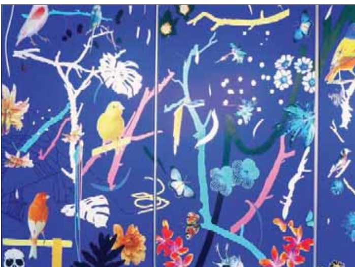
دان بالدوين من الرسامين المشاركين في «مجموعة معارض»

ألمانيا فيستعمل تقنية رمي حجر الأبريك على مساحة واسعة من لوحته «إنها هارماتان». ونستدل منها على حالة رجل يصارع أفكاره ضمن عاصفة نفسية يمر بها شبيهة إلى حد كبير بتلك المعروفة في نيجيريا بعاصفة «هارماتان»، فتلامس نازرها بتفاصيلها الصغيرة المتسعة بالأحاسيس والمشاعر المتضاربة. وبتقنية الشد الملون نراقب عن كثب لوحة للاميريكي ديلان فتتخللها زهوراً تطفو على المياه أو أعشاباً بحرية تغرق. وكان لونها بالأحمر والأزرق الداكن من خلال تقنية «البيكس ميديا».