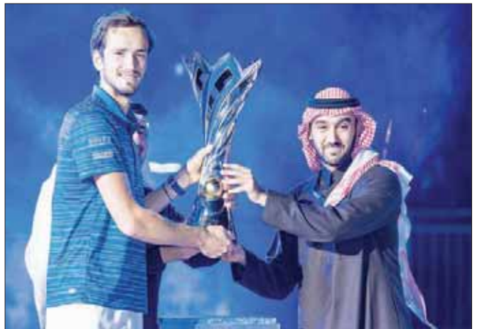
الأمير عبد العزيز الفيصل يتوج الروسي دانيال ميدفيديف بطلاً لكأس الدرعية للتنس أمس

هذا الجمهور الرائع على حضوره وتفعله الاستثنائي». وفي مباراة الرضوية للمركز الثالث والربع، استطاع الأميركي جون إسبنر انتزاع فوز صعب من منافسه الألماني يان - لينارد ستروف بنتيجة 4 - 6 ثم 5 - 1 لصالح إسبنر في المجموعة الثانية، واختتمت مجموعة فاصلة بواقع 13 - 11 لصالح إسبنر، في مباراة امتازت بالتنافسية الشديدة بين اللاعبين.