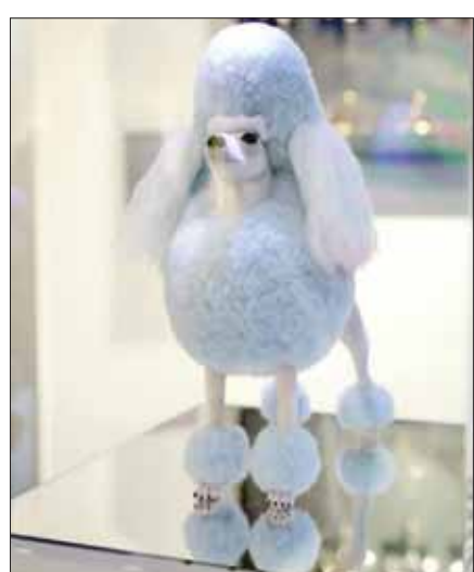
لوحة لغريغوري سيف في «مجموعة معارض» من لوحات جوناثان بول «الكلب الأبيض»