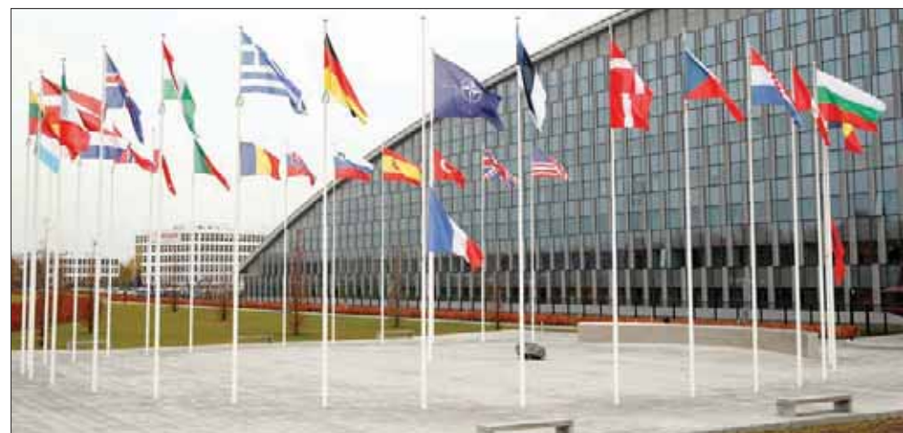
أعلام أعضاء حلف الناتو أمام مقره الرئيسي في بروكسل

أنه في ظل قيادة الرئيس شارل ديغول انسحبت فرنسا من الجانب العسكري للناطو وأعلنت قواعد الحلف على الأراضي الفرنسية. واستأنفت فرنسا العضوية الكاملة في الحلف تحت إشراف الرئيس جاك شيراك. ويعتبر اتحاد الدفاع الأوروبي الذي يعتبر في جوهره شراكة فرنسية - ألمانية، الخطوة الأولى لهذه التحولات. والأهم من ذلك، أطلق الاتحاد الأوروبي مبادرة «امن أوروبا وهويتها الدفاعية» كإطار عمل لبناء تحالف عسكري كامل من جميع الدول الـ 27 الأعضاء (ما عدا بريطانيا).