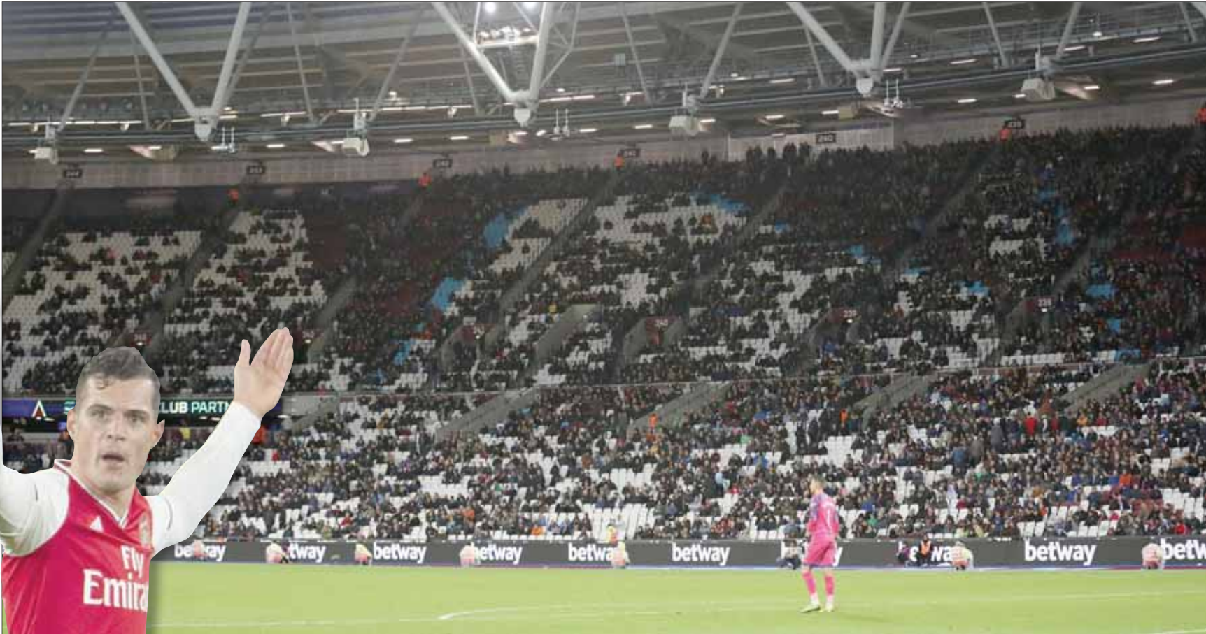
الجماهير في ملعب لندن الأولمبي انقلبت على فريقه وستهام وأرسنال

وتبدو لي هذه الحجة مقنعة، ربما لأنها تتماشى مع اعتقادنا أننا لم نتحول إلى مجتمع من المستهلكين فحسب، وإنما أصبحنا متحمسين للغاية تجاه هذا التغيير، ونستمع عندما نجد أشياء تشكو شأنها، وربما يكون هذا مجرد سبب من أسباب عدة وراء صيحات الاستهجان بالملاعب. إلا أنه مع تنامي ظاهرة إطلاق هذه الصيحات داخل الملاعب شيئاً، يبدو أنها لا تخدم أحداً، وبغض النظر عن الأسباب، إطلاق صيحات الغضب بوجه فريقك لا يجدي.