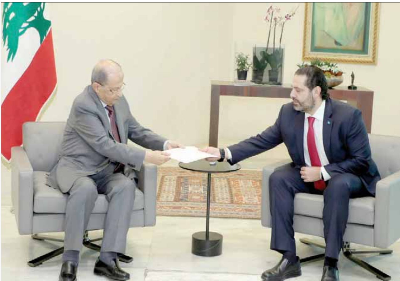
الحريري خلال تقديمه استقالته الى الرئيس عون خلال لقائهما في بعدا

وقال نادر، في تصريح لـ«الشرق الأوسط» متسائلاً: «كيف يعارض (التيار) حكومة يرأسها العماد عون؟ ألا يعلم أن ذلك سيؤدي لإضعاف موقع الرئاسة؟ اليس الرئيس عون رمزهم؟ ألا يعلمون أنه بالنهاية يشكل مع الرئيس المكلف الحكومة التي لا تمر تشكيلاً دون توقيعه؟». وشدد نادر على أنه «إذا كان (التيار) اشتاق للشارع بعدما اكتشف أن جزءاً كبيراً من مؤيديه تعاطفوا مع الثورة، فمحاولة العودة إلى الشارع اليوم ستكون بائسة، فمن أمضى 15 سنة في الحكم وتولى الوزارات الأساسية لا يمكنه أن يصبح في الشارع في ليلة وضحاها، فهو يحتاج لينسحب إلى سنتين على الأقل أو 3 من السلطة قبل العودة إلى موقعه السابق».