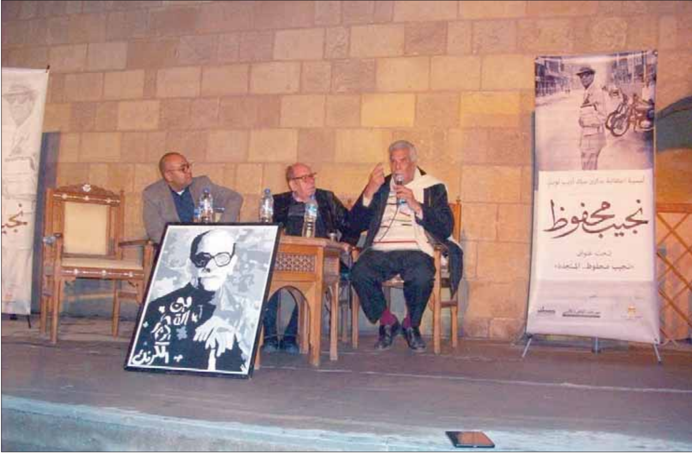
ندوة محفوظ في بيت السحيمي

يذكر أن «الجامعة الأميركية بالقاهرة»، أعلنت منح «جائزة نجيب محفوظ»، هذا العام، وضم الأعمال المقدمة للمشاركة في دورة العام الحالي إلى الأعمال التي سوف تقدم للترشح العام المقبل، على أن يتم تكريم الأعلام المتقدمة خلال العام، وإعلان الفائز واحد من بينهما، خلال الاحتفالية التي سوف تقيمها الجامعة في ديسمبر (كانون الأول) 2020. وبرر بيان الجامعة تأجيل الجائزة هذه العام بوجود خطط لتطويرها قيد التنفيذ بالفعل، وإجراء بعض التعديلات على لوائحها الداخلية.