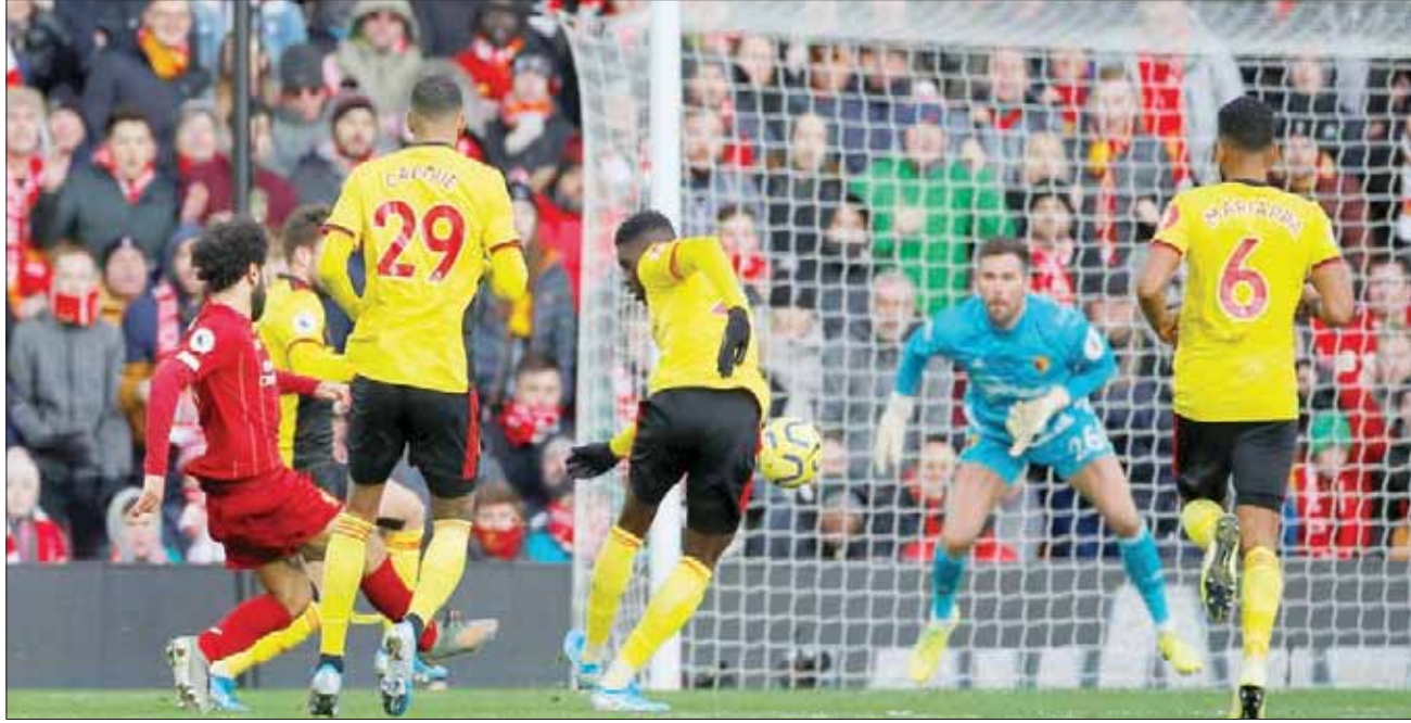
صلاح نجم ليفربول (يسار) يسجل هدفه الأول في مرمرى واتفورد

وهي المباراة الـ34 دون خسارة للليفربول في الدوري منذ سقوطه أمام مانشستر سيتي في يناير (كانون الثاني) الماضي (28 فوزاً و5 تعادلات) وهي الأولى له في دوري الدرجة. كما أنه لم يخسر على أرضه في الدوري للمباراة الـ49 على التوالي وتحديداً منذ سقوطه أمام كريستال بالاس في 23 أبريل (نيسان) 2017. وخلافاً لزياراته الثلاث الأخيرة