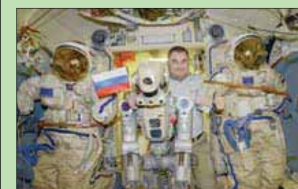
فيودور بجانب رائد الفضاء الروسي ألكسي أوتشيبين على متن المحطة الفضائية الدولية