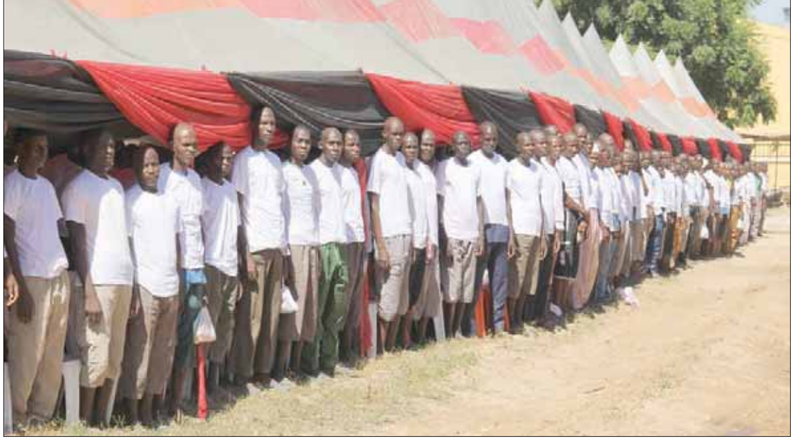
سجناء بعد إطلاق سراحهم وتسليمهم لإعادة التأهيل بعد احتجازهم لمدة تصل إلى 4 سنوات للاشتباه بصلتهم بعناصر «بوكو حرام» خلال احتفال في مايدوغوري شمال شرقي نيجيريا في نوفمبر الماضي (أ.ف.ب)