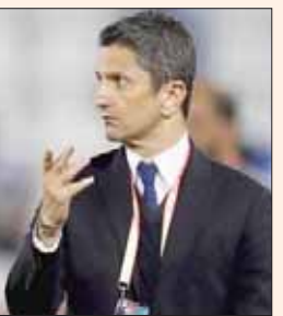
رازفان لوشيسكو مدرب الهلال

الفريق بعد تعافيه من الإصابة»، في المقابل، أكد معين الشعباني المدير الفني لفريق الترجي التونسي لكرة القدم أن الإمكانيات العالية لنادي الهلال السعودي والمهارات والإمكانات الفريدة للاعبين الأجانب هي ما منحتة التفوق على الترجي خلال مبارياتها أمس السبت في بطولة كأس العالم للأندية.