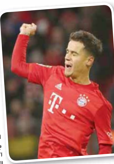
كوتينيو يحتفل بثلاثيته من سداسية البايرن في مرمرى بريمن

وفي المباراة الثانية، وبعد أيام من تأهله إلى أبطال خروج المغلوب بدوري أبطال أوروبا، استطاع دورتموند تحقيق جراح ماينز برعاية. ومنح القائد ماركو روسي التقدم لدورتموند بتسديدة قوية في بداية الشوط الأول، وضاعف الإنجليزي جيدون سانتشو الفارق في الدقيقة 62 محرراً هدفه الثامن في الدوري هذا الموسم، قبل أن يساهم في الثالث الذي سجله تورغان هاراز في الدقيقة 69، واختتم نيكو شولتز الرباعية بتسديدة منخفضة قبل 6 دقائق من النهاية.