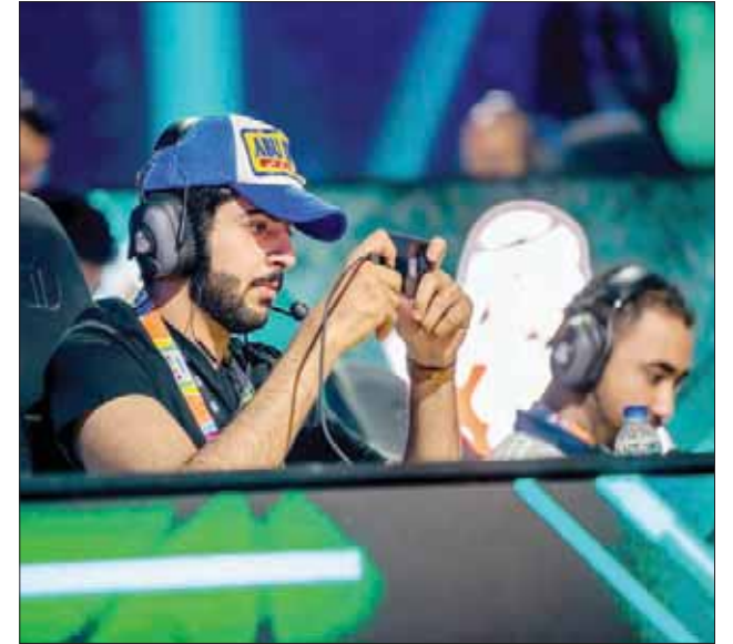
بطولة كأس العالم لتحدي بجي موبايل التي اختتمت في الرياض أمس شهدت مشاركة 32 فريقاً من حول العالم