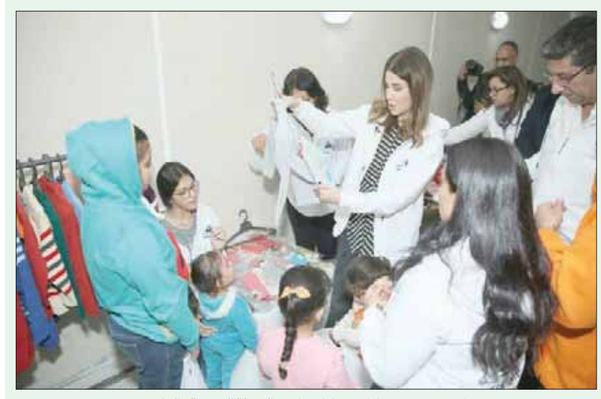
نانسى عجرم خلال مشاركتها في الحملة الخيرية بالقاهرة