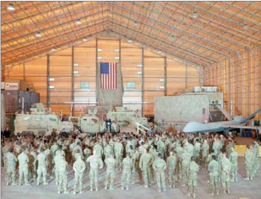
صورة أرشيفية لنائب الرئيس الأميركي مايك بنس أثناء زيارته لقاعدة الأسد الجوية في العراق

طالبت السفارة الأميركية في بغداد أمس إيران بالتوقف عن مهاجمة قواعد في العراق فيها قوات عراقية وأخرى أميركية ومن باقي دول التحالف الدولي لمحاربة تنظيم «داعش»، كما كررت السفارة تهديداً أطلقه أول من أمس وزير الخارجية الأميركي مايك بومبيو، برد «حاسم» على إيران أو وكلائها، في حال اعترضوا الجنود الأميركيين أو شركاء واشنطن العراقيين.