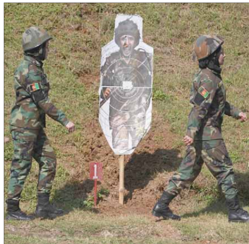
جنديتان من الجيش الأفغاني خلال مشاركتهما في تدريب عسكري باكاديمية تدريب الضباط في تشيناي جنوب الهند أول من أمس

التي يحتاجها أفراد الجيش النظامي. ووفقاً لتجنيد وتدريب ما يقرب من 7000 من أفراد جيش الإقليم، معظمهم في المناطق المضطربة، حيث حققت الحكومة الأفغانية مكاسب إقليمية. تحتسب المكاسب التي تحقق في ساحة المعركة أهمية خاصة في موسم القتال من أجل تعزيز النفوذ على طاولة المفاوضات. فبعد أن طردت القوات الأفغانية كثيراً ما سعت الأخيرة إلى السيطرة على الأراضي التي جرى تطهيرها مؤخراً. جاءت الجولة الأخيرة من المحادثات بين كبير مبعوثي الولايات المتحدة للسلام، زلمي خليل زاد، وممثلي «طالبان» في العاصمة القطرية الدوحة، لتتحد من العنف وتساعد في وقف إطلاق النار، وتمهد الطريق للمحادثات بين المتمردين والحكومة الأفغانية. لكن المحادثات توقفت، الجمعة، بعد خمسة أيام من بدايتها حتى يتمكن مفاوضو «طالبان» من التشاور مع قادتهم. كان الرئيس ترمب، قد جمد محادثات السلام فجأة في سبتمبر (أيلول) بعد هجوم شنته «طالبان»، غير أنه أعلن عن استئناف المفاوضات في نوفمبر (تشرين الثاني) خلال زيارته الأولى لأفغانستان. وقال ترمب إن «طالبان» كانت مهتمة بوقف إطلاق النار، لكن يبدو أن تصريحاته لفتت انتباه المسلحين.