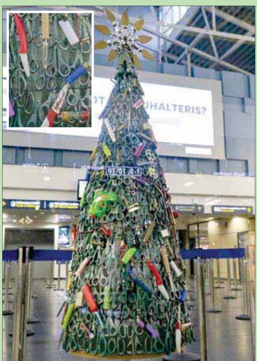
شجرة أعياد الميلاد في مطار فيلنيوس عاصمة ليتوانيا مزينة بالأشياء التي تمت مصادرتها من المسافرين لأسباب أمنية مثل السكاكين والأسلحة اللعب وغيرها لتذكير المسافرين بأن أمنهم يأتي أولاً

روبووت يزور المحطة الفضائية الدولية. حصل الروبوت «فيودور» على شهرة عالمية، باعتباره أول «رجل» يقوم برحلة إلى الفضاء، في أغسطس (آب) الماضي، وأجرى خلالها «اختبارات» على متن المحطة الفضائية الدولية. وبينما كان الجميع بانتظار الأخبار عن رحلته الفضائية الجديدة، أعلن يفغيني دودوروف، مدير مؤسسة «التقنيات الأندرويدية»، التي صممت هذا الروبوت بأن «فيودور لن يعود إلى الفضاء»، وقال في حديث لوكالة «ريا نوفوستي»: «لا شيء لديه يفعله هناك، لقد أنجز مهمته». وكشف المسؤول الروسي عن روبوت جديد يجري العمل عليه، ليقيم بهمهم على متن المحطة الفضائية الدولية، لكن في الفضاء المفتوح، وليس داخل المحطة، موضحاً أن «فيودور لن يقوم بتلك المهام بسبب قدميه، ولا حاجة لدى الروبوت بقدمين خلال المهام في الفضاء المفتوح»، ويجري حالياً العمل على الأجزاء لأول