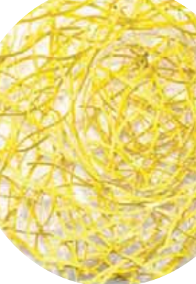
«القمح» مات ديفايين من الألونوم والستانلس ستيل

ومع لوحة «القوق» لجابيس فيريبيكي نتابع تقنية «الكولاج» التي يعتمدها عادة في أعماله وبتقان محترف. فهو من خلال قصاصات ورق قديمة يستخرجها من الصحف وغيرها لنشهد بالفعل مجموعة فنون ضمن معرض واحد يتبع لرائته التقاط أنفاسه في فسحة فنية لا تتبته غيرها.