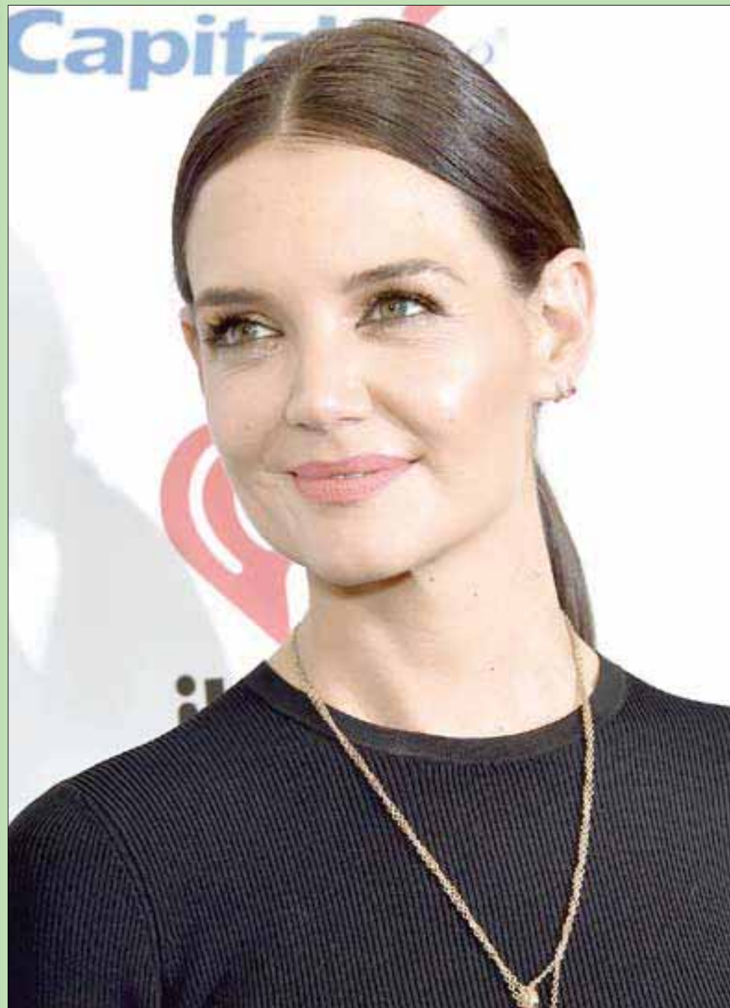
المثلة الأميركية كاتي هولمز حضرت حفل «هارت راديو» في ماديسون سكوير غاردن بمدينة نيويورك

وتحضرني الآن واقعة خيالية فيقال: إن هناك رجلاً مدخناً في الرابعة والتسعين من عمره، عبر الشارع دون أن ينتبه لإشارة المرور الحمراء، وعندما توسط الشارع خطر على باله أن يولع سيجارة، فأخرج «البكت» والولاعة وما أن أشعلها، وإذا بسيارة مسرعة تهفه فسقط وليس (في عينه قطرة) - يعني اتكل على الله ومات - وعندما انتشلوه وجدوا سيجارته بجانبه ويخرج منها (خيوط دخان) - مثلما قال: نزار قباني - وكثبت الصحف في اليوم الثاني عن الحادث: لقد ثبت بالدليل القاطع بعد حادثة الأسم: أن التدخين مضر بالصحة ويؤدي إلى تقصير العمر والموت المبكر.