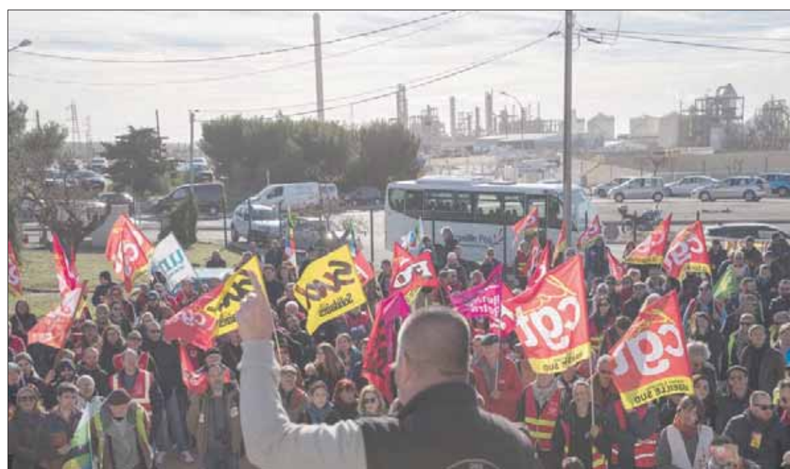
النقابي أوليفييه ماتو يخاطب أمس عمال نقابات مضرين في جنوب فرنسا

سنوات، بلا مشاكل مع أن هذه النصوص تثير غضب النقابات أيضاً، لأنها تنص على دمج الهيئات التمثيلية للموظفين وتلغي على مر الوقت عشرات الآلاف من الممثلين المنتخبين في الشركات الفرنسية.