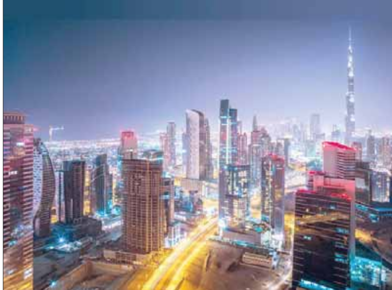
تعتزم الإمارات وضع خريطة اقتصادية جديدة للبلاد وتطوير مشاريع وسياسات اقتصادية لتحقيق قفزات نوعية (وام)

أعلنت الإمارات أمس، عن مساعيها لإطلاق استراتيجية تنموية تستهدف الخمسين عاماً المقبلة، التي ستتم صياغتها خلال عام 2020، وإطلاقها في 2021، الذي يصادف اليوبيل الذهبي -خمسين عاماً- على تأسيس البلاد في عام 1971، حيث تستهدف البلاد مرحلة ما بعد النفط بالاستعداد على اقتصاد المعرفة. وجاء الإعلان عن الاستراتيجية من خلال الشيخ محمد بن راشد آل مكتوم نائب رئيس الدولة رئيس مجلس الوزراء حاكم دبي، والشيخ محمد بن زايد آل نهيان ولي عهد أبوظبي نائب القائد الأعلى للقوات المسلحة، حيث أعلن أن عام 2020 سيكون «عام الاستعداد للخمسين»، من خلال الإطلاق في أكبر استراتيجية عمل وطنية من نوعها للاستعداد للدولة الاتحادية والمحلية، والاستعداد أيضاً للاحتفال باليوبيل الذهبي لدولة الإمارات في عام 2021، على أن تشارك كل فئات الطبقات المجتمعية الإماراتية من مواطنين ومقيمين وقطاع عام وخاص وأهلي في صياغة الحياة في دولة الإمارات للخمسين عاماً المقبلة.