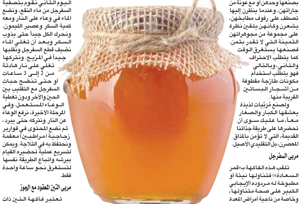
مربى التين المعقود مع الجوز تعتبر فاكهة التين ذات

والقلب والرثة. والمعروف بأنها تنبت فقط مع إطلالة فصل الخريف، وبالتحديد في شهر سبتمبر (أيلول). أما المربيات المصنوعة منها مبروشة أو مقطعة ومغطسة بصلصة السكر (القطر) فيعتبرها أهل القرى في لبنان زينة مائدة فصل الشتاء، ولا يمكن الاستغناء عنها؛ لما فيها