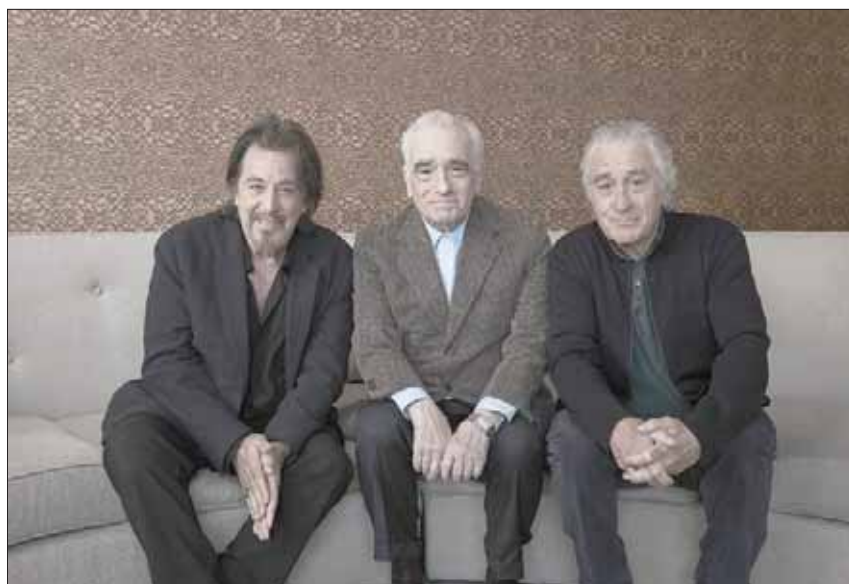
صورة تجمع المخرج مارتن سكورسيزي مع بطلي فيلمه «الأيروني» آل باتشينو وروبرت دي نيرو

اعترف «لي» أن النتيجة النهائية لم تكن مثالية، فالمشهد الأخير شديد الإضاءة بضوء النهار جاء سيئاً. غالباً ما كان «لي» يدفع بصناعة الأفلام إلى الأمام، وبالتالي فإن فكرة تقليل السن عن طريق بناء شخصية بالكومبيوتر كانت فكرة جيدة. وأضاف: