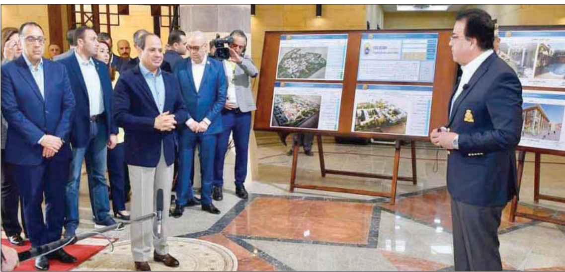
السيسي لدى تفقده فرع «جامعة الملك سلمان» بشرم الشيخ (من صفحة المتحدث الرئاسي)

افتتح الرئيس المصري عبد الفتاح السيسي، مساء أمس، أعمال النسخة الثالثة من «منتدى شباب العالم» في مدينة شرم الشيخ بجنوب سيناء، داغياً لوقف «التمييز على أساس الدين أو اللون أو الجنس». وقال السيسي أمام جلسة الافتتاح، إننا «خلقنا على اختلافنا لتكامل وتعاضدنا، معتبراً أن المنتدى «رسالة محبة و سلام قائمة على الحوار البناء واعتزازنا ببناء عالم يزخر بالبحر والاشراق». وكان من أبرز الحضور الرئيس الفلسطيني محمود عباس أبو مازن، والأمين العام لجامعة الدول العربية أحمد أبو الغيط، والأمير خالد الفيصل، مستشار خادم الحرمين الشريفين وأمين مكة المكرمة، ورئيس مجلس النواب الليبي عقيلة صالح.