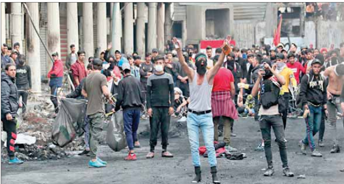
مواجهات محتجين مع قوات الأمن في شارع الرشيد ببغداد مطلع الشهر الحالي

وحسّل الساعدي رئيس الجمهورية «مسؤولية تاريخية في الإبقاء على الأصل في الإصلاح من عدمه ويكون قرار تكليف مرشح لمنصب رئيس مجلس الوزراء من اختيار الشعب وليس (تدويراً وإعادة إنتاج) لرجال الأحزاب الفشل والفساد».