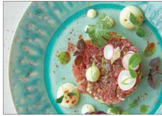
«ناساو» نكهة البحر الأبيض المتوسط في الإمارات

تتأشد الحواس في مساحة خلابة تزخر بأروع الديكورات، مع نكهات استثنائية مستوحاة من الشواطئ المشمسة، حيث سيتم تقديم وجبات غداء وعشاء فاخرة. وتخيّم على المطعم أجواء الحياة الحلوة الإيطالية، حيث يسبق فريق طهاةنا المتمرسين منتجات محلية طازجة، كما يقدمون أطباقاً خالية من السكر والغلوتين، ليمنى للجميع التمتع بأطباق شهية وصحية في آن معاً. وصممت رواقاً قائمة الطعام بعناية شديدة، واستلهمت مجموعة مميزة من القبلات التي تشمل اللبنة بالكماة السوداء مع خضراوات صغيرة مثيلة، وأسباخ لحم بقر وأغويو على الطريقة العثمانية مع جينة قشقوان ذاتية، بالإضافة إلى كبد الإوز المسخن وكريم بروليه التمر وسلطة العس والسيلبريك مع البندق والزعتر.