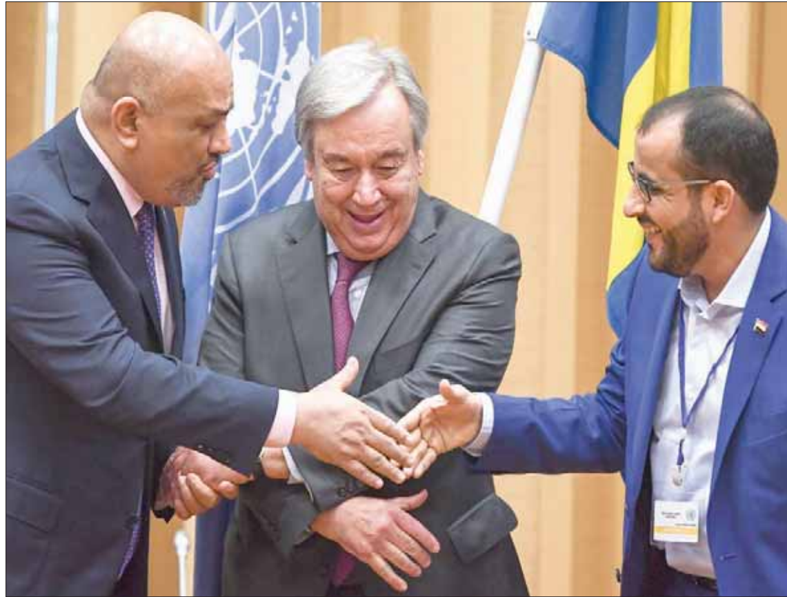
الأمين العام للأمم المتحدة متوسلاً رئيسي وفدي الحكومة اليمنية والحوثيين لدى انتهاء مشاورات السويد نهاية العام الماضي

ويدوره، يرى المبعوث الأممي أن ما تعلمه «حقاً ويقوة، أن هناك بعض القضايا التي لن يتم حلها عن طريق الاتفاقات على المستوى دون الوطني - اتفاقات محددة في أماكن مختلفة». ويقول: «علينا أن نعالج القضايا الأساسية المتمثلة في السيادة والشرعية من خلال اتفاق لإنهاء الحرب». وفي أي حل سياسي، في أي مكان، في أي صراع - والحديث لغريغيت مع موقع أخبار الأمم المتحدة - «هو أمر بالغ الصعوبة. وستتطلب سياسية من المستوى الذي يتطلب الكثير للانتقال من الحرب إلى السلام، ويتطلب من هؤلاء الذين يقودون الحرب تغيير الطريقة التي ينظرون بها إلى مناصريهم، وتغيير إمكاناتهم، ووضع حد لآمالهم بنصر عسكري والبدء في التواصل مع أعدائهم وجعلهم جزءاً من المستقبل»، متابعاً: «إنه تحول كبير في أي حرب أهلية، إنه تحول هائل؛ ما اعتقد أنه يحدث الآن في اليمن هو أننا أخيراً بدأنا نرى هذا التحول... لقد بدأنا نرى في قلوب وعقول أولئك الذين يتخذون القرارات حول الحرب، الرغبة على المستوى الأساسي، بأنه لا يوجد أي احتمال لتحقيق تقدم عسكري، أنه لا يوجد شيء يمكن كسبه في ساحة المعركة، وأن هناك انتصاراً كبيراً بالطبع يمكن تحقيقه على ساحة المفاوضات».