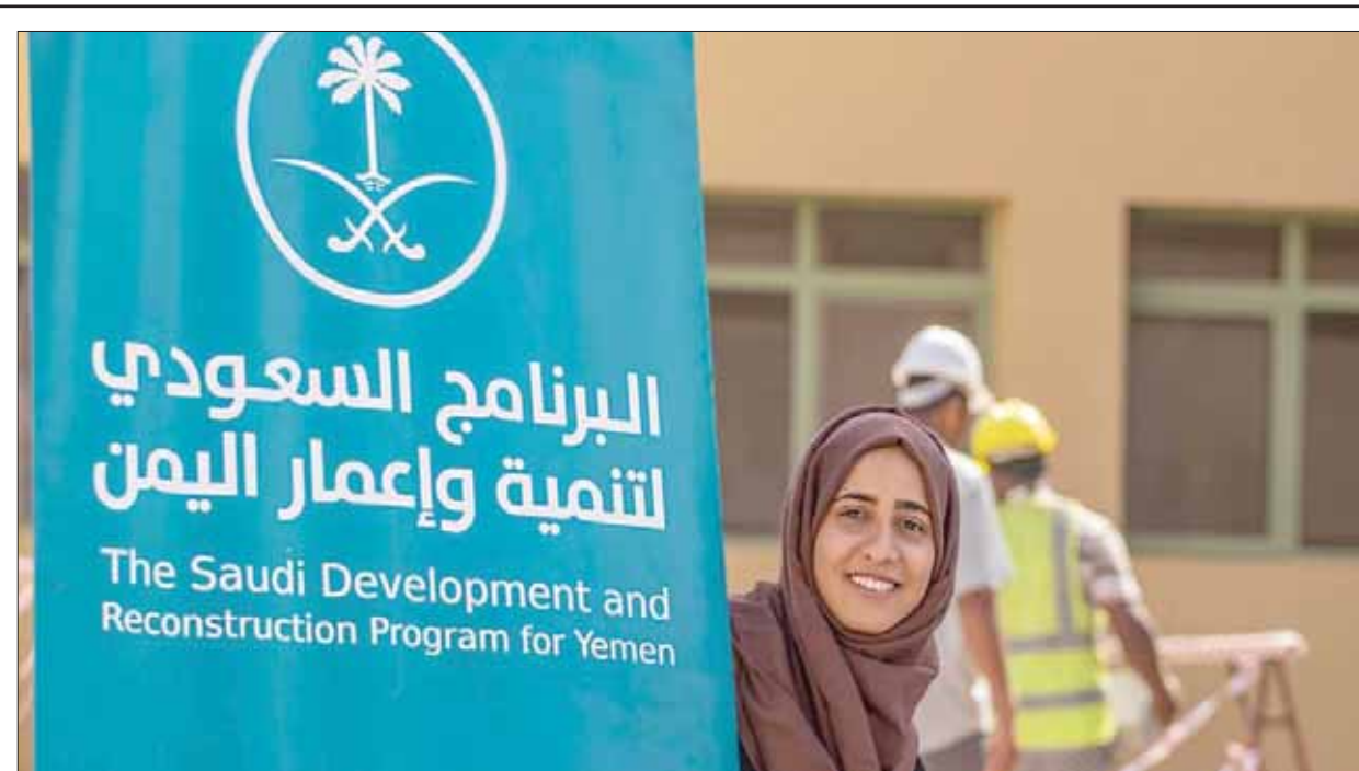
يمنية تظهر إلى جانب شعار برنامج الإعمار السعودي لدى وصول الأجهزة المقدمة لتأهيل مستشفى عدن العام (واس)