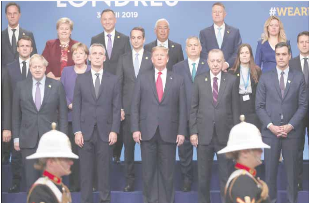
صورة تذكارية لأعضاء الحلف الأطلسي في ختام قمتهم الأخيرة في لندن

طلب «توضيحات» حول ما تقوم به تركيا في سوريا، وخططها في هذا البلد. مرة أخرى، لم يجد الرئيس الفرنسي ضالته، إذ لم يتردد في «ضحكي» بشركاء التحالف في الحرب على الإرهاب، ويشجع تركيا التي اتهمها بأنها على «تواصل» مع شركاء له «داعش» على مواصلة سياساتها المدمرة في سوريا. ولا يكتفي ماكرون بطرح التساؤلات، ووضع الإصبع على الجرح الأطلسي، بل يعرض مجموعة من «المقترحات».