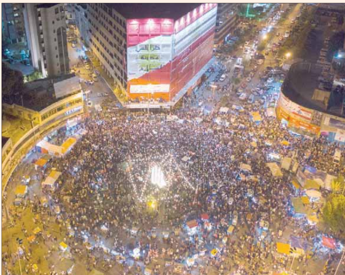
من ساحة النور في طرابلس (إ.ب.)

ريما، وهما من الجنسية السورية. ونتيجة الحادثة، عثت المدينة خالية من الغضب، فقرر عدد من الشبان التوجه إلى الباحة الخارجية لمبنى بلدية الميناء التي حملوها مسؤولية ما حصل نتيجة عدم تجاوبها مع مطالب الأهالي ترميم المنازل، فاقدموا على إشعال النيران في حاويات النفايات وحطمو زجاج الباب الخارجي، ومن ثم اقتحموا المكتبة والقاعة الرئيسية وعيّنوا بمحتوياتها. واستقدم الجيش اللبناني تعزيزات إلى القصر البلدي، ومحيط منزل رئيس البلدية عبد القادر علم الدين في حي البوابة، إثر تدفق عشرات المحتجين إلى المكان، وإحراقهم أثاث المكتب الشخصي لعلم الدين، كما ورد في «الوكالة الوطنية للإعلام». وتزامنت التحركات بوجه البلدية ورئيسها مع عملية قطع عدد من الطرقات في المدينة، وقد طالب المحتجون باستقالة رئيس البلدية. وعلى الأثر، عقد عدد من أعضاء مجلس بلدية الميناء اجتماعاً قرر على أثره 6 من هؤلاء الاستقالة، منهم رئيس