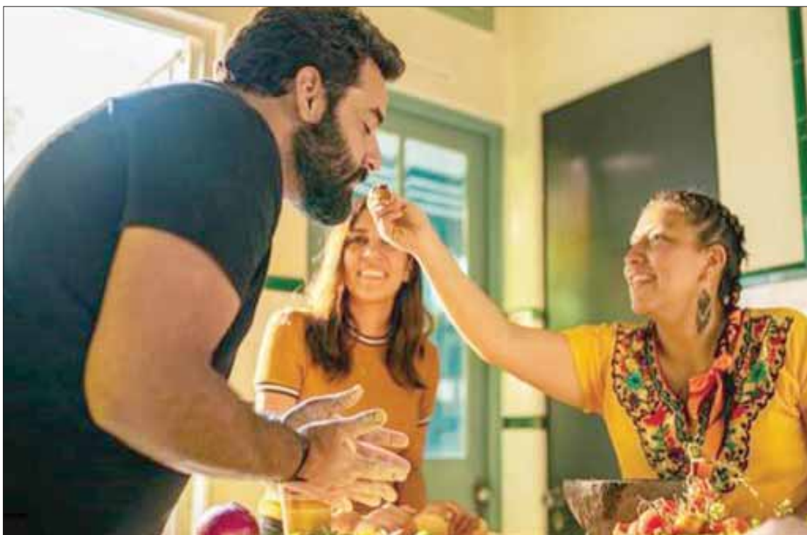
الفكرة من وراء التجربة هي تنشيط الوصفات التقليدية القديمة حول العالم

تتأشد الحواس في مساحة خلابة تزخر بأروع الديكورات، مع نكهات استثنائية مستوحاة من الشواطئ المشمسة، حيث سيتم تقديم وجبات غداء وعشاء فاخرة. وتخيّم على المطعم أجواء الحياة الحلوة الإيطالية، حيث يسبق فريق طهاةنا المتمرسين منتجات محلية طازجة، كما يقدمون أطباقاً خالية من السكر والغلوتين، ليمنى للجميع التمتع بأطباق شهية وصحية في آن معاً. وصممت رواقاً قائمة الطعام بعناية شديدة، واستلهمت مجموعة مميزة من القبلات التي تشمل اللبنة بالكماة السوداء مع خضراوات صغيرة مثيلة، وأسباخ لحم بقر وأغويو على الطريقة العثمانية مع جينة قشقوان ذاتية، بالإضافة إلى كبد الإوز المسخن وكريم بروليه التمر وسلطة العس والسيلبريك مع البندق والزعتر.