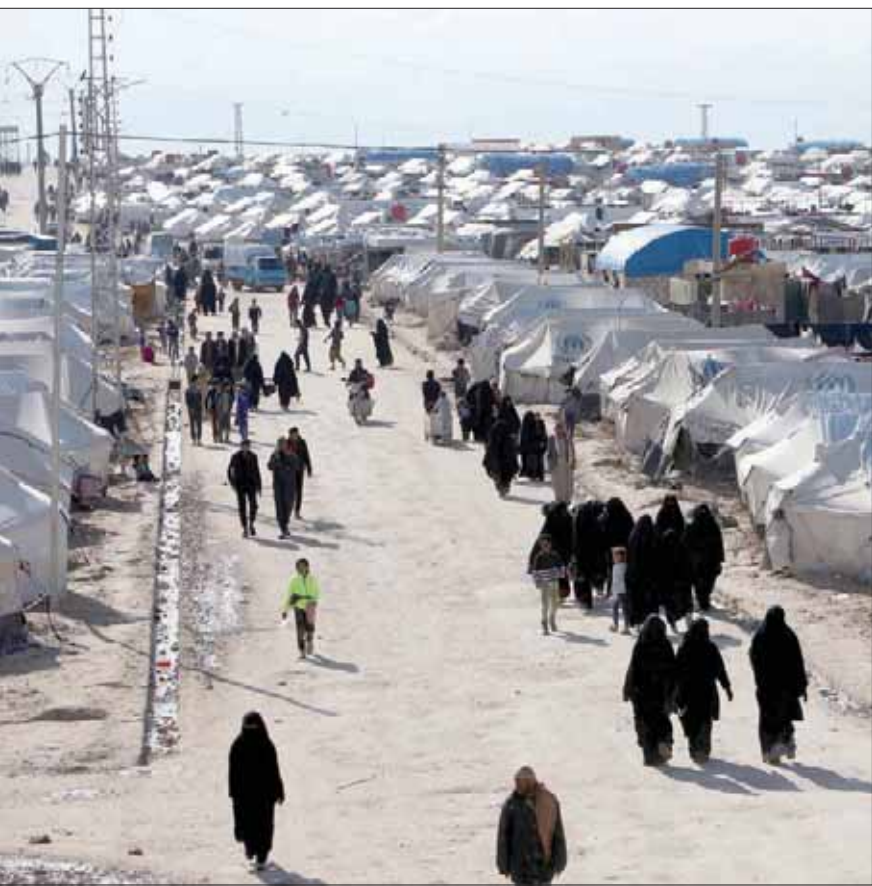
نساء في مخيم الهول شمال شرقي سوريا

كان مجلس الشيوخ الأميركي أقر قبل يومين نصاً من أجل إحياء ذكرى الإبادة الأرمنية عبر الاعتراف بها رسمياً، في إشارة للمذابح التي تنهت السلطنة العثمانية بارتكابها في حقبة العام 1915. وعدت الخطوة تاريخية لكنها أثارت حفيظة تركيا