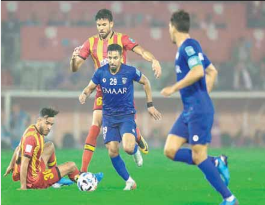
الهلال كان الأكثر استحواداً وسيطرة وتحكماً في المباراة

واكمل الهلال المباراة بـ10 لاعبين بعد طرد لاعبه محمد كنو بالإذار الثاني، علماً بأنه نال البطاقتين الصفراوين في ظرف دقيقتين (83 و85).