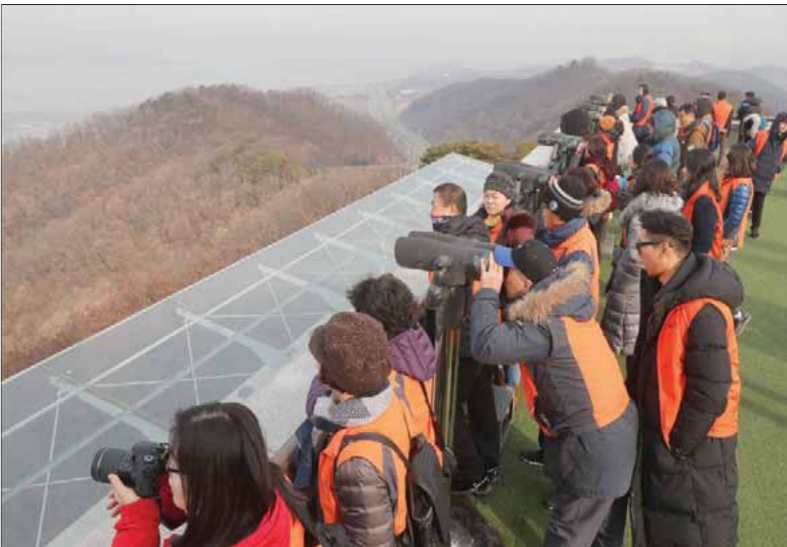
سياح في موقع حدودي بكوريا الجنوبية ينظرون في اتجاه الجارة الشمالية

إجراءات بناء الثقة. وعقد كيم ثلاثة اجتماعات مع ترمب منذ يونيو (حزيران) 2018، لكن هذه المفاوضات النووية مع واشنطن جُذدت منذ أن انهارت قمة هانوي في فبراير (شباط) بينما أصدرت بيونغ يانغ سلسلة تصريحات متشددة في الأسابيع الأخيرة مع اقتراب المهلة النهائية. بدورها، انتقدت كوريا الشمالية هذا الأسبوع واشنطن، واصفة إياها بـ «الغبية» لطبها عقد اجتماع لمجلس الأمن الدولي على خلفية القلق المتزايد بشأن الصواريخ قصيرة المدى التي يتم إطلاقها من الدولة المعزولة. وقال المتحدث باسم وزارة الخارجية الكورية الشمالية إنه عبر ترتيبها الاجتماع، «ساعدتنا (واشنطن) على اتخاذ قرار حاسم بشأن المسار الذي سنسلكه».