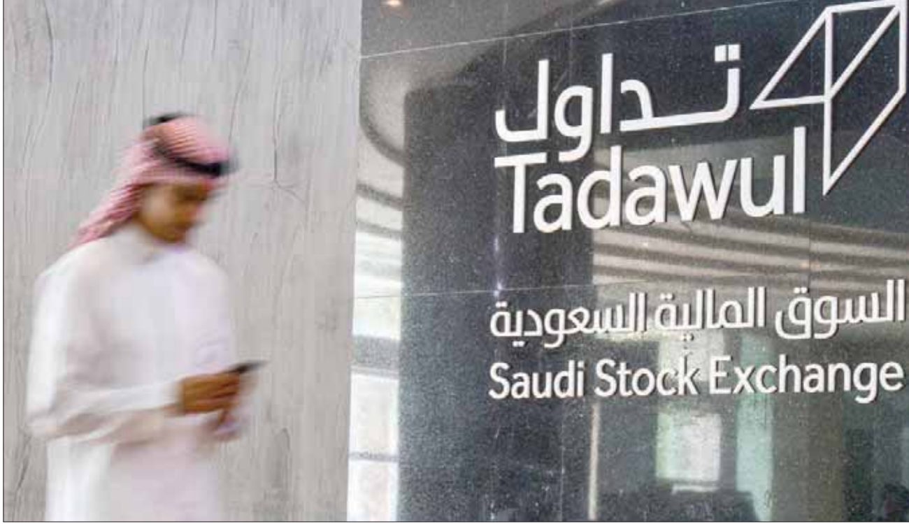
الأسهم السعودية تبدأ الأسبوع وسط تحفز للتداول في سهم أرامكو

ولفت البراك إلى أن مستويات استقرار سهم «أرامكو» قد تكون حتى سعر 36 ريالاً، وفقاً للتحليل النظري، عادلة، إلا أن ارتباط السهم بأسعار النفط إضافة إلى ما تمثله الشركة من جذب للمستثمرين نتيجة لحجم العوائد التي ستدفعها، جمعياً محفزة لكسر هذا الحاجز العادل لتقييم السعر إلى مستويات أعلى. وقال البراك في حديثه لـ«الشرق الأوسط»: «لا أعتقد أن أي محفظة استثمارية في العالم وتستثمر في الأسواق المالية الدولية تتجاهل سوق كسوق الأسهم السعودية بل لا أعتقد جزماً ألا تأخذ حصة ولو بسيطة فيه».