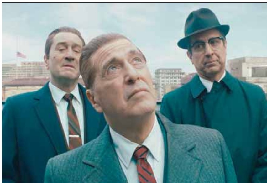
مشهد من فيلم «الأيروني» يظهر فيه آل باتشينو وروبرت دي نيرو مع راي رومانو

من الممثلين بفيلم «أفجرز». بعد خمسة أشهر، خضع جميع ممثلي الجزء الثاني من فيلم الرعب «إت تشايتز تو» الذي كان جميع ممثليه من الشباب لعمليات تصغير السن بالكومبيوتر لكي تتطابق هياكلهم مع ملامحهم السابقة في الجزء الأول من الفيلم. وفي رابعة مارتن سكورسيزي، «ذا إريشمان»، أو الأيرلندي، نهاية نوفمبر (تشرين الثاني) شاهدنا تأثير تصغير أعمار جميع نجومه، روبرت دي نيرو، آل باتشينو، وجو بيسكي - جميعهم في السبعينيات من العمر حالياً - لتصوير حياة رجال العصابات على امتداد مراحلهم السنوية.