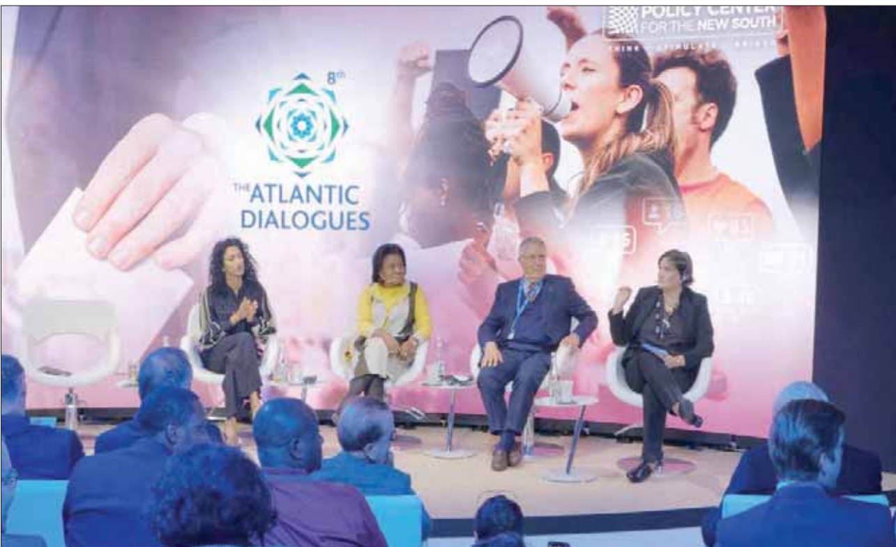
جانب من ندوة «أزمة الديمقراطية» بمؤتمر «حوارات أطلسية» بمراكش أمس

صنع ذريعة للمطالبة بالاحترام وقمع أصوات الشباب». واعتبر محمد بن عيسى، أمين عام منتدى أصيلة ووزير الخارجية المغربي الأسبق، أن الاحتجاج «هو مشهد عن حالتنا كديمقراطيين، ممثلاً لذلك بما يحدث في العالم العربي، الذي قال عنه إنه كان يطغى عليه الربيع العربي، رغم أنه لم يكن ربيعاً على الإطلاق، كما لم يكن عربياً بشكل كلي، أيضاً». وأضاف بن عيسى أن العنف يتولد عن مفهوم وممارسة أساسية لما يسمى بـ «الديمقراطية والعدالة الاجتماعية»، حيث يشعر الناس بالاستغلال من قبل أولئك الذين يصوتون عليهم. غير أن الإشكال الكبير، بضيف بن عيسى، يتمثل في الظروف المجتمعية، حيث تحتاج الديمقراطية إلى ديمقراطيين... إلى أناس لديهم شروط أساسية للتعلم واحترام دولة القانون. لكن في مجتمع فقير وجاهل، هذا غير ممكن. ولذلك لم يعد الناس يؤمنون بالمؤسسات.