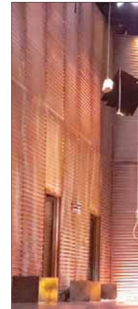
تأبلوه استعراضياً لمشهد إعدام ريا وسكينة

الفقرات النصية التي ترويها «بديعة» جاءت موظفة لخدمة المصق الترويجي للعرض «ولدت للموت وحرمت وتألقت... فسكت سكات الموت بقلب نابض... إلى أن نبش قبري فزال سكاتي وتكلمت... فقلت».