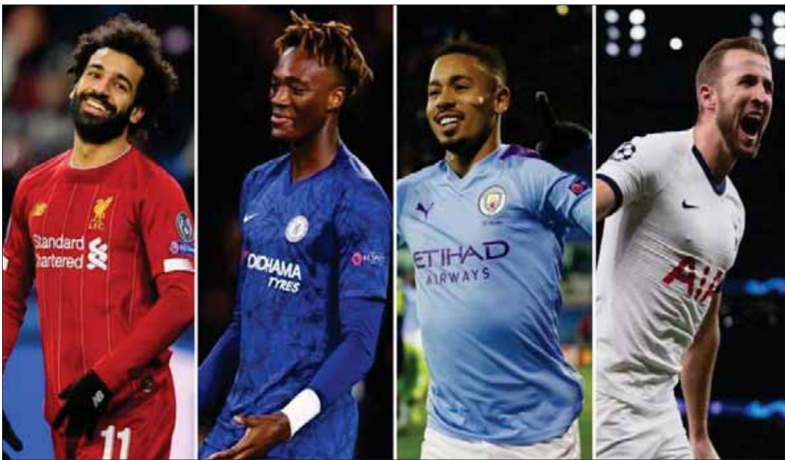
هاري كين وخيسوس وإبراهيم وصالح كان لهم دور في تأهل توتنهام وسيتي وتشيلسي وليفربول

سان بطرسبرغ، الذي يأتي في التصنيف الثاني والعشرين. وربما يكون لايبزيغ الألماني، الذي يأتي في التصنيف الثالث والعشرين، هو المفاجأة الحقيقية في دور السبعة عشر لدوري أبطال أوروبا، مع العلم بأن جميع هذه الأندية لم تلعب في دور المجموعات لدوري أبطال أوروبا هذا الموسم من الأساس.