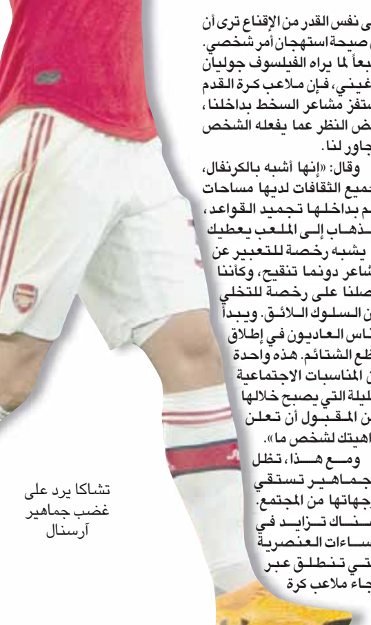
تشاكاك بيرد على أرسنال غضب جماهير

على نفس القدر من الإقناع ترى أن كل صيحة استهجان أمر شخصي، وتبعاً لما يراه الفيلسوف جوليان لا يبدلون أدنى مجهود لتعويض الفارق.