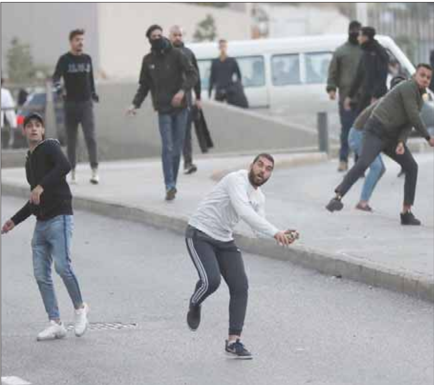
متظاهرون مناصرين للثلاثي الشيعي يرمون بالحجارة على القوى الأمنية في وسط بيروت أمس

وبين عناصر مكافحة الشغب التي أطلقت القنابل المسيلة للدموع وهي تطاردهم وتبعدهم إلى خلف ما يعرف بـ«جسر الرينج». وأعلنت قوى الأمن الداخلي عبر حسابها على «تويتر» أن عناصر مكافحة الشغب تعرضت لاعتداءات ورمي حجارة ومفرقات نارية من قبل بعض الأشخاص طالبة «وقف هذه الاعتداءات وإلا فستضطر لاتخاذ إجراءات إضافية وأكثر حزماً». ونشرت في وقت لاحق فيديو على حسابها عبر «تويتر» «يظهر الاعتداء بالحجارة والمفرقات النارية على عناصر مكافحة الشغب».