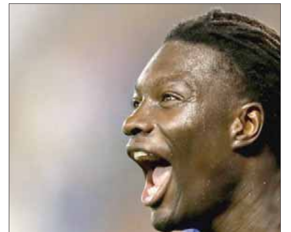
غوميز ساهم في قيادة الهلال إلى نصف نهائي المونديال

وأضاف: «الفريق قام بعمل كبير طوال المباراة، وأنا سعيد للغاية بهذا الانتصار، واعتقد أننا نستحق الفوز لأننا لعبنا