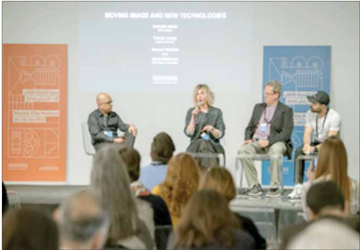
من إحدى جلسات النقاشية