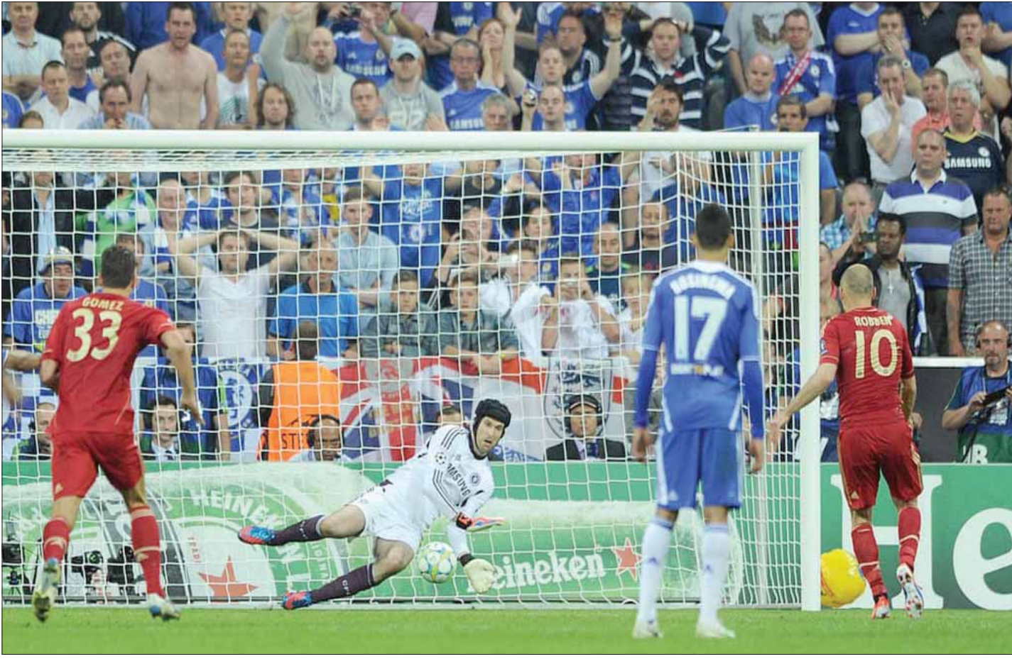
تالّق تشيك وتصدى لركلة جزاء سددها روبين وفاز تشيلسي بدوري الأبطال عام 2012

يقول تشيك: «إنها حياة مختلفة تماماً. عندما تكون لاعباً فإنك تكون مسؤولاً عن نفسك فقط، لأنك جزء من الفريق وتكون مسؤولاً عن صورة النادي. لكن المسؤولية الآن هي العمل مع مجموعة كبيرة من الأشخاص، والتأكد من أن الجميع يعمل كوحدة واحدة، لأن هذه هي قوة أي فريق دائماً. وإذا عمل الجميع معاً، فإننا نحقق هدف واحد فسوف نحقق الفوز حينئذ».