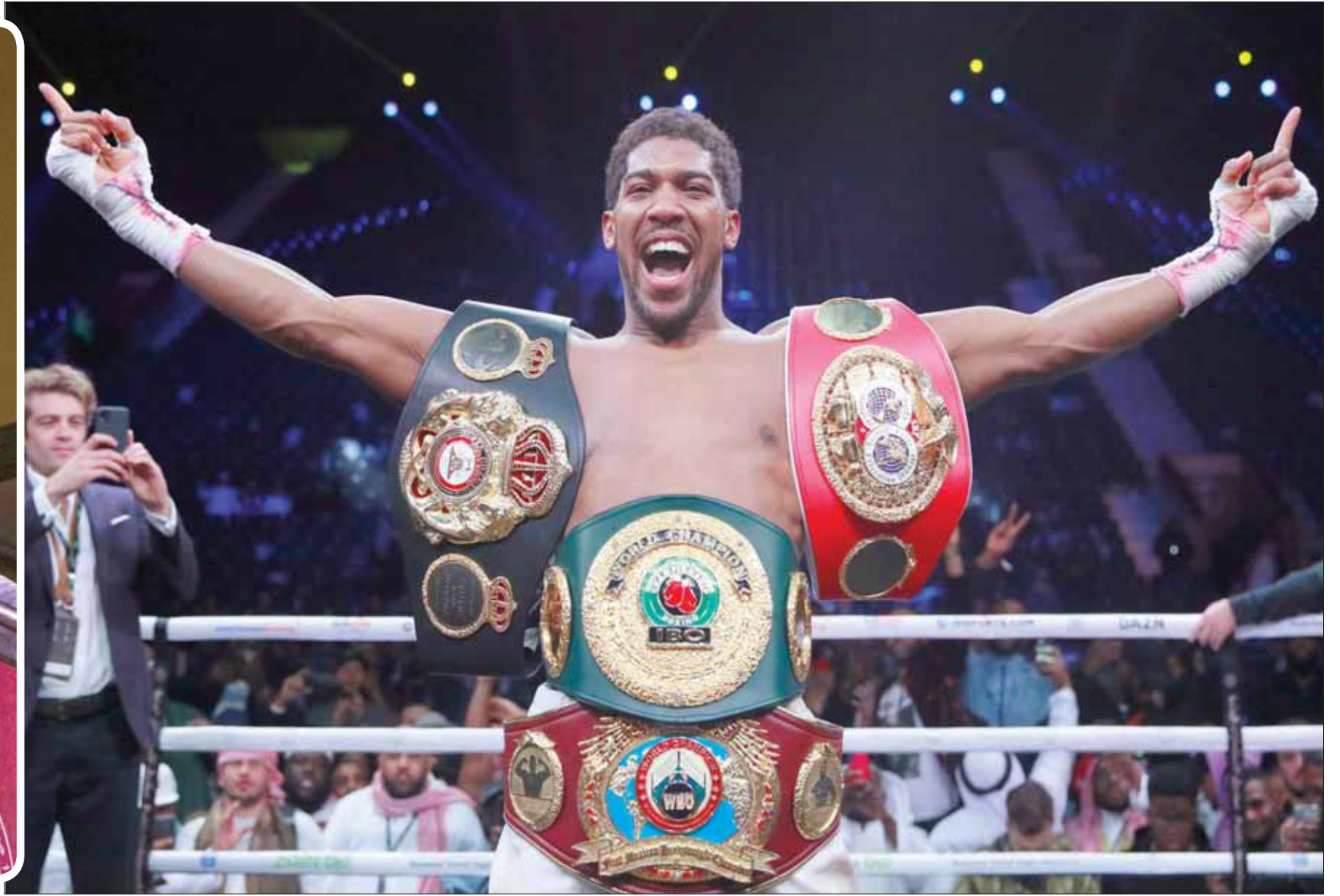
جوشوا بعد انتصاره أمس

التاريخي الذي جمعه بالأميركي رويوز وهو وزن 20 كيلوغراماً أكثر من منافسة، حيث خسر الكثير من الوزن منذ المواجهة السابقة بينهما، إذ دخل النزال الذي يعتبر الأحدث الأهم في مسيرته وهو وزن 107,5 كغ، وبلغ وزن جوشوا 112,4 كغ في يونيو (حزيران) الفائت ولكنه خسر من وزن العزل من أجل أن يحسن تحركاته على الحلبة.