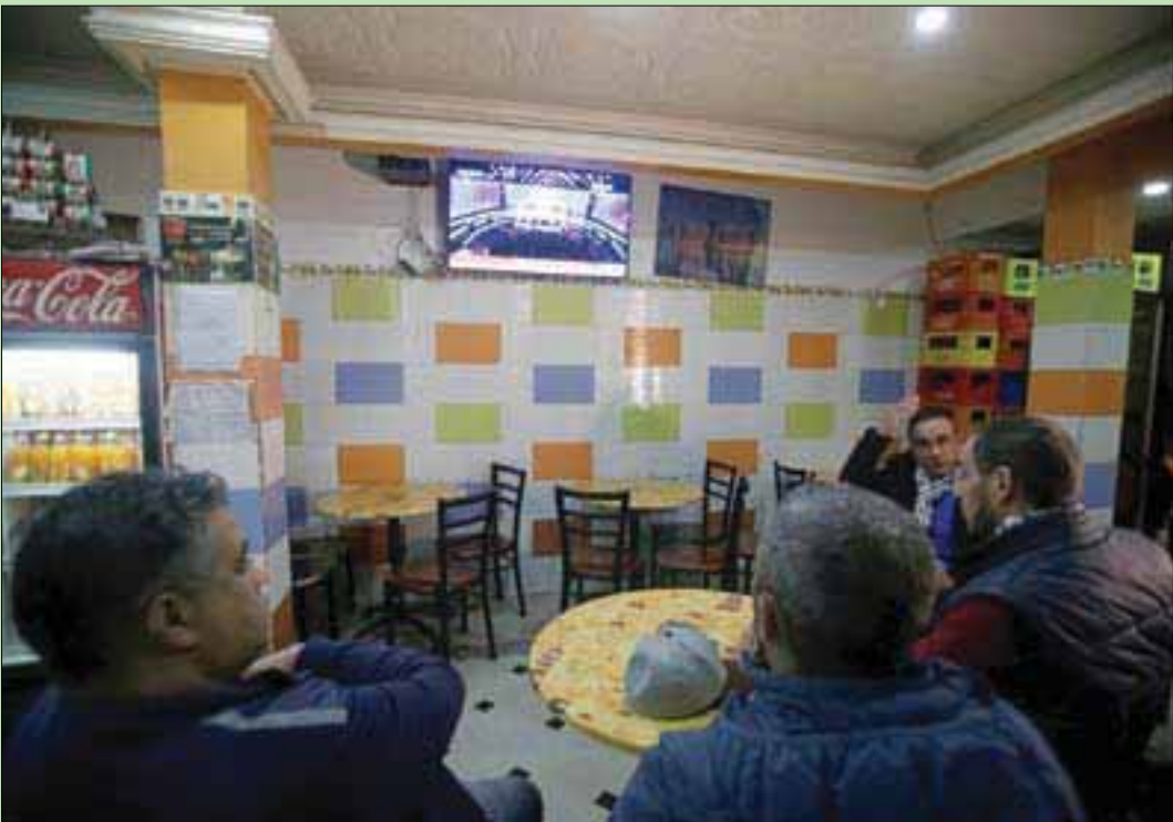
جزائريون يشاهدون المحاكمة على شاشات التلفزيون

بحق السعيد كان ذاته ضد مديري المخبرات سابقاً، اللواء محمد مدين واللواء بشير طرطاق، ومرشحة «رئاسية» 2014 لولاية حنون، وبناء على التهم نفسها. في غضون ذلك، انطلقت أمس بالخارج عملية التصويت في أوساط المهاجرين الجزائريين. وأظهرت صور فيديو، نشرها بعضهم في فرنسا، على حساباتهم بـ«فيسبوك» ملائمة حادة عند مدخل قنصليات، بين مؤيدين ورافضين للاستحقاق. وبحسب تقارير مراسلي صحف جزائرية بفرنسا، فقد كان الإقبال ضعيفاً على صناديق الاقتراع في الفترة الصباحية. تجدر الإشارة إلى أنه يعيش بفرنسا نحو 700 ألف جزائري، وعددهم في بقية دول العالم يفوق 4 ملايين، أقل من نصف العدد يحق لهم الانتخاب.