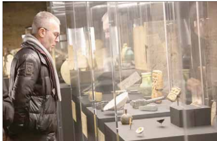
الزوار أبدوا إعجابهم بقطع المعرض

أقدم بكثير مما توقع. ولفت إلى أن أكثر القطع التي جذبت انتباهه هي السيراميك والفخار التي عُرِضت في المعرض، وأثار ما قبل التاريخ البشري، إضافة إلى الأبنية المنزلية والأواني المطيخية والخزف والمعادن مثل البرونز.