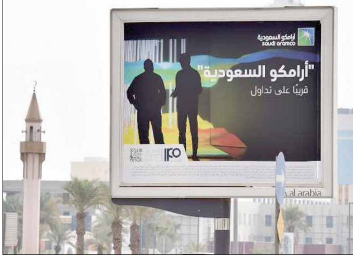
«سوق الأسهم السعودية» تنهيا لتداول أسهم أرامكو الأربعاء المقبل (أ.ف.ب)

ومن المتوقع أن تسجل السيولة النقدية المتداولة خلال تعاملات هذا الأسبوع قفزة كبيرة، حيث سيساهم إدراج «أرامكو»، في ارتفاع معدلات