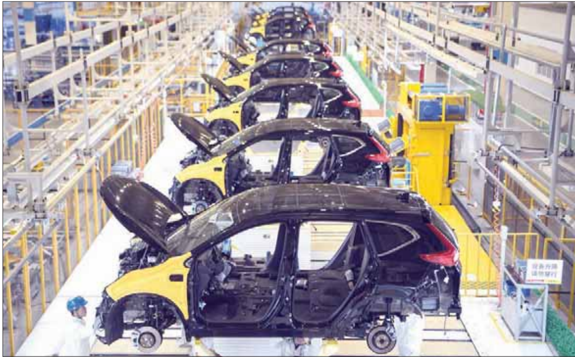
عاملون في مصنع للسيارات في ووهان بمقاطعة هوبي بوسط الصين.

يحاولان منذ إضفاء الطابع الرسمي على أي اتفاق يكون مكتوباً. وابتدئ كودلو حذراً حيال مناقشة جولة التعريفات الجمركية التي ستبدأ في 15 ديسمبر (كانون الأول)، وتشمل ما قيمته 160 مليار دولار من الواردات الصينية - بما في ذلك المواد الاستهلاكية الشعبية مثل الهواتف الجوالية. وقال في هذا السياق: «ليست هناك مهلة لتسوية» مضيفاً أن القرار النهائي لترمب وحده.