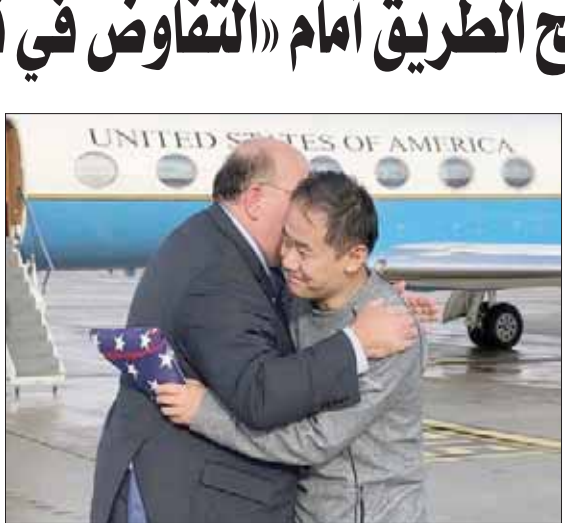
السفير الأميركي لدى سويسرا يرحب بالمواطن الأميركي بعد الإفراج عنه

وقال ترمب: «تولي إدارتي أهمية كبرى لإطلاق سراح الأميركيين الأسرى، وسنواصل العمل الدؤوب لإعادة كل مواطنينا المحتجزين ظلماً خارج الولايات المتحدة». من جانبه، نشر ظريف