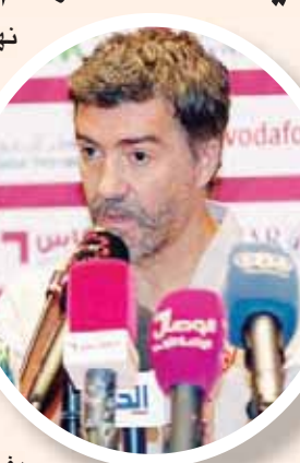
الدوحة، «الشرق الأوسط»

وعما إذا كان توقع الوصول إلى النهائي، قال المدرب: «جئنا هنا للفوز وبلوغ النهائي والمنافسة على اللقب، هذا ما جئنا من البحرين لأجله. قدمنا مباريات رائعة أمام كثير من المنتخبات في التصفيات الآسيوية وفي البطولة الحالية ونعمل دائماً على الفوز في المباريات رغم علمنا بصعوبة الفوز. اللاعبون سعداء للغاية بما تحقق حتى الآن في التصنيف. علينا أن نركز على مدار 90 دقيقة اليوم وتقديم مباراة أفضل من سابقتها».