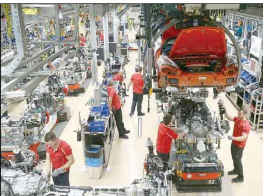
جانب من أحد مصانع سيارات بورشة في ألمانيا

وفي المقابل، قال رئيس خدمة العملاء من الشركات في البنك التعاوني المركزي الألماني، أوفه بيرجهاوس، إن الشركات المتوسطة بوجه عام «في حالة ثابتة تماماً» بفضل الواسادات الرأسمالية السميكة على وجه الخصوص.