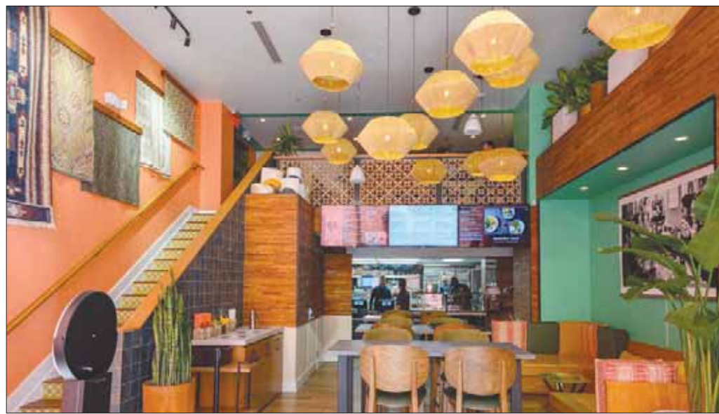
مطعم عالمي يعتمد على مطابخ عدة يشتهر بها المهاجرون في الولايات المتحدة

افتتح الشيف الفنزويلي أنريكي ليماردو، الذي يعتبر من بين أشهر الطهاة في واشنطن، مطعمه الجديد على مقربة من البيت الأبيض، واختار اسم «أكل المهاجر» أو Immigrant Food، وهذا الاسم قد يستفز الرئيس ترمب المعروف بموقفه المعادي للمهاجرين في الولايات المتحدة.