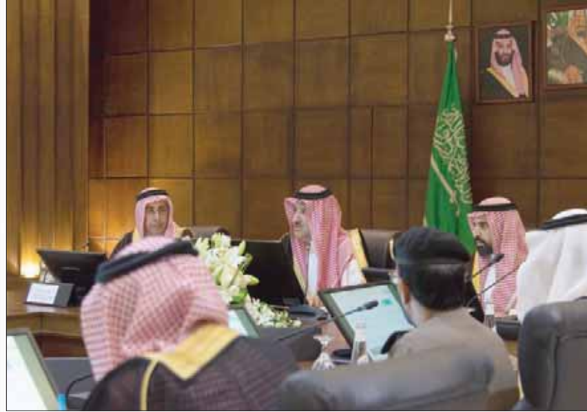
جانب من الاجتماع الأول لجلس هيئة تطوير المنطقة

هل يطلب ثوار العراق المستحيل أم نصبهم الواقعي؟ في بلد نفضي ثري لا تكون الحقوق الأساسية للمواطنين ترفاً ولا منة. ولا يكون تنظيف الفساد من رابع المستحيلات. بعد الغول والعنقاء والخلل الوفي. لقد تغول الفاسدون وبيات من الطبيعي جداً أن يساقوا للقتل ويسلموا مفتاح ما اكتنزوا ويعودوا من حيث أتت بهم الحافة.