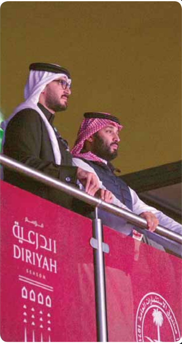
ولي العهد السعودي يتابع النزال التاريخي أمس