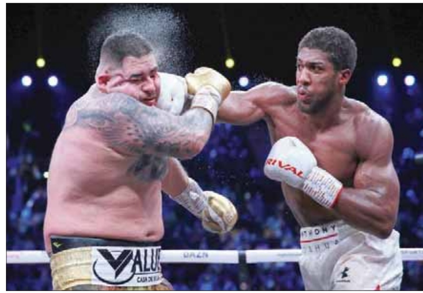
جانب من النزال التاريخي الذي جمع الملاكمين جوشوا ورويوز في ميدان الدرعية بالرياض