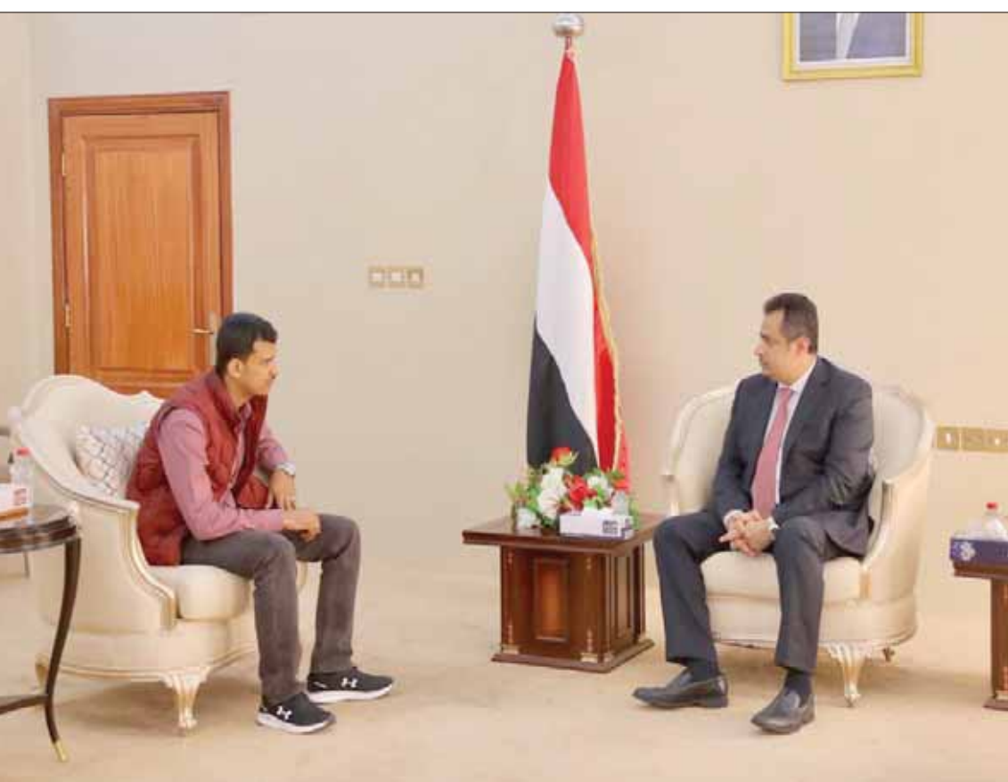
رئيس الوزراء اليمني الدكتور معين عبد الملك لدى استقباله نجل الحمادي في عدن أمس

الذين تقدموا للصفوف لخوض المعركة المصرية ضد ميليشيات الحوثي الانقلابية، وظل مخلصاً ووفياً لمبادئه، حتى آخر لحظة من حياته.» وكانت قيادة محور الجيش اليمني في تعز اعتبرت في بيان سابق «استهداف الحمادي هو استهداف محور تعز وللمجيش الوطني في المشروع بحد ذاته عثرة أمام المشروع الحوثي.» وقالت إنه «كان مع قلة قليلة من رفاقه شرف إنشاء وتشكيل نواة الجيش الوطني والمقاومة الشعبية في تعز بادئاً مسيرة خالدة من النضال والكفاح الجمهوري ضد خصوم الجمهورية والنزعة ليصبح اسماً لامعاً ونجحاً ساطعاً يشار له بالبنان في تعز وفي اليمن كلها.» وتعهدت قيادة محور تعز «الجميع بانها ستبذل كل جهودها لمعرفة ملايين حادثة الاغتيال الأثمة التي لم تنضج مجرياتها بعد، رغم بدء التحقيقات الفورية والكشف عن ملايين الأسماء.» وللمحافظ رئيس اللجنة الأمنية تشكيل لجنة متخصصة من ناحية وسرعة الكشف عن ملايين الحادثة ومعرفة الحقيقة وكشفها.»