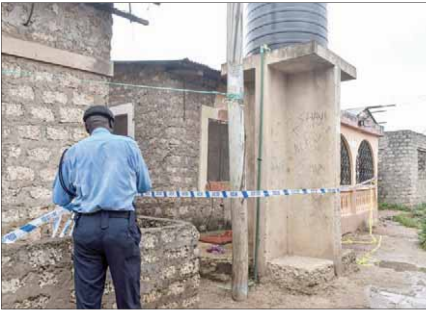
ضابط يؤمن منزلاً قُتل فيه ثلاثة من المشتبهين بالإرهاب في مومباسا

في غضون ذلك، كانت الأمم المتحدة قد اعتبرت نهاية شهر نوفمبر (تشرين الثاني) الماضي «حركة الشباب» الصومالية «الأكثر خطراً» في الصومال خصوصاً ومنطقة القرن الأفريقي بشكل عام.