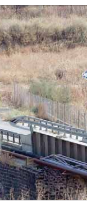
جسر بين الحدود الأردنية والإسرائيلية

وقال تقرير «بتسليم» إن منع البناء والتطوير الفلسطيني في منطقة الأغوار يمس على وجه الخصوص بنحو 10 آلاف فلسطيني يسكنون في أكثر من 50 تجمعاً سكانياً (مضارب) في مناطق C، حيث تسعى إسرائيل بشنّى الطرق لترحيلهم عن منازلهم وأراضيهم. وتمنع السلطات هذه التجمعات من أي إمكانية للبناء القانوني وفق احتياجاتها وترفض ربطها بشبكتي الماء والكهرباء.