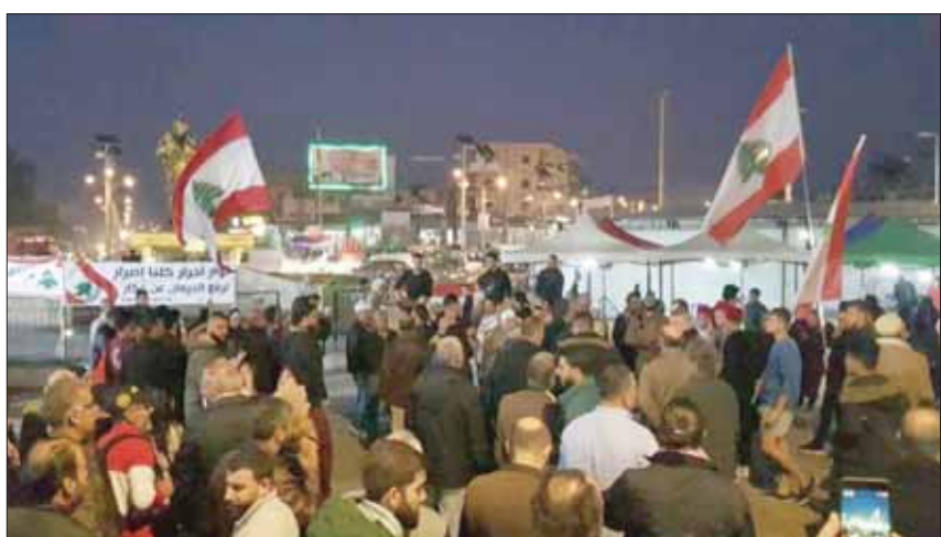
«قافلة الثورة» لدى وصولها إلى بلدة حلبا مساء أمس (الوكالة الوطنية)

انطلقت أمس، مسيرة شعبية أطلق منظموها عليها شعار «قافلة الثورة» من بلدة كفرمرمان في الجنوب، وعبرت مختلف المناطق شمالاً، وصولاً إلى «ساحة النور» في مدينة صيدا مدني يؤدي لمزيد من التدهور المالي والاقتصادي. واعتبر الخبير الاقتصادي