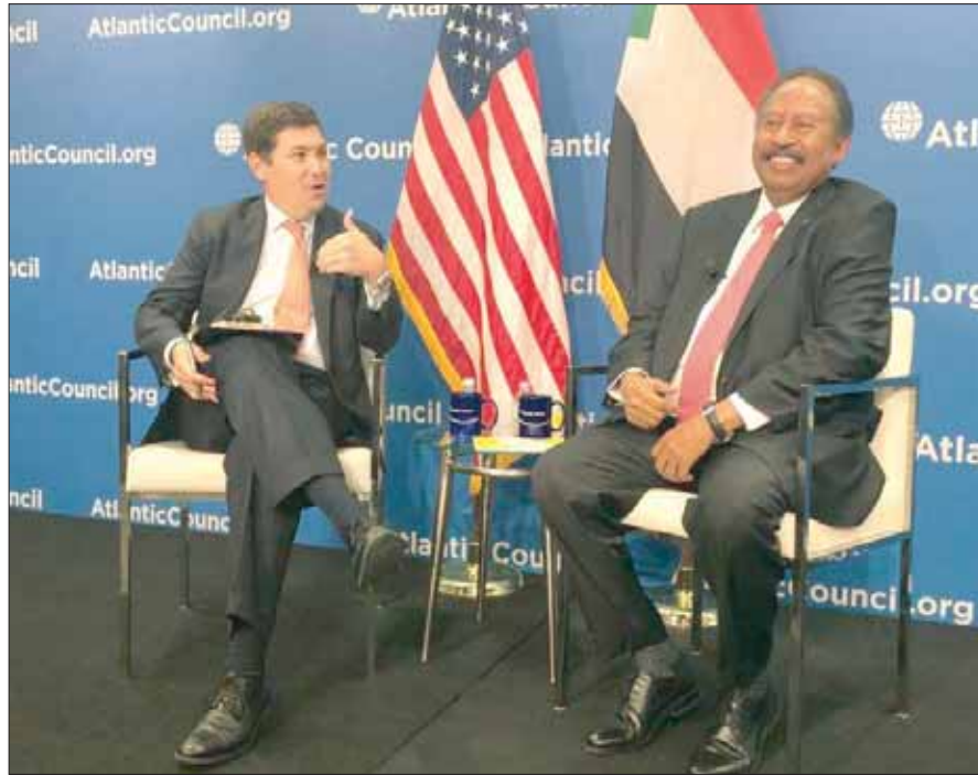
حمدوك متحدثاً خلال ندوة مركز أتلانتك في واشنطن وحاوره كاميريون هدسون

وقال حمدوك إن ترفيع التمثيل الدبلوماسي بين البلدين، سيعزز العلاقات الثنائية، مضيفاً الثورة السودانية سلميتها تمثل أنموذجاً يُحتذى في الإقليم. وأضاف البيان أن الطرفين تحدثا عن رفع اسم السودان من اللائحة الأميركية للدول الراعية للإرهاب، وقد أكد صفتها الرسمية «فيسبوك»، ومع ذلك لكل حق التظلم والاستئناف، والقضاء هو من يقرر مشروعية الحصول على هذه الأموال من عدمها. وإجاز مجلسا السيادة والوزراء، الأسبوع الماضي، قانونا لتفكيك النظام السابق، وحل حزب المؤتمر الوطني، ومصادرة جميع ممتلكاته ودوره، كما اتخذ إجراءات جنائية في مواجهة رموزه، والتقى حمدوك، في البيت الأبيض، مستشار الأمن القومي الأميركي، روبيرت أوبراين، وتباحث في إزالة اسم السودان من قائمة الإرهاب وسد النهضة. وقالت الخارجية السودانية في بيان أمس، إن المسؤول الأميركي أكد دعم بلاده والرئيس دونالد ترمب للحكومة الانتقالية حتى يتحقق التحول الديمقراطي المستدام في السودان.