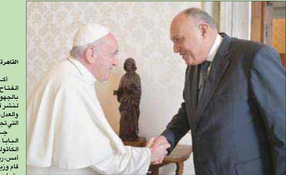
البابا فرنسيس رئيس الفاتيكان لدى استقباله وزير الخارجية سامح شكري أمس

القاهرة، «الشرق الأوسط» أكد الرئيس المصري عبد الفتاح السيسي، اعتزاز بلاده بالجهود التي يقوم بها الفاتيكان لنشر قيم التسامح والرحمة والعدل، والأهم بتعزيز الروابط التي تجمع بين الفاتيكان والسلم البابا فرنسيس بابا الكنيسة الكاثوليكية ورئيس الفاتيكان، أمس، رسالة إلى الرئيس السيسي، قام وزير الخارجية سامح شكري بتسليمها في ختام زيارته الحالية إلى الفاتيكان.