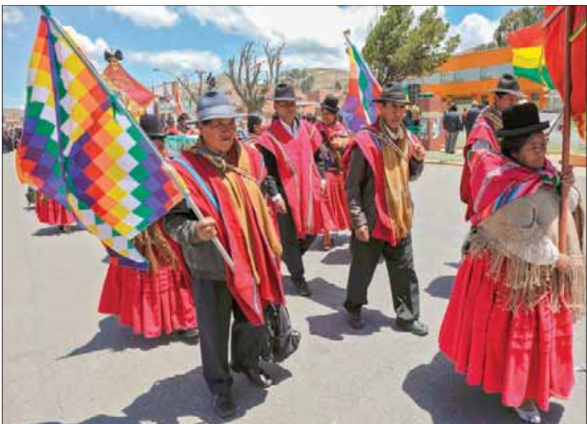
احتجاجات السكان الأصليين في بوليفيا الموالين لموراليس تثير الرعب لدى الحكومة اليمينية المؤقتة

بعد أكثر من 13 عاماً، وافقت الحكومة الأسبوع الماضي، إلى اتفاقات مع قادة الاحتجاجات لتهدئة الأوضاع عقب اشتباكات بين قوات الأمن ونصراً موراليس أسفرت عن مقتل نحو 30 شخصاً. وقال وزير داخلية بوليفيا لـ«رويترز» إن حكومة بلاده المؤقتة تشدّ مساعدة إسرائيل للسلطات