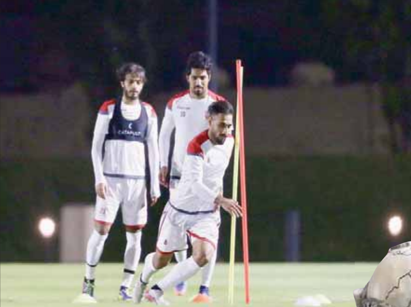
المنتخب البحريني خاض آخر تمريناته تأهباً لموقعة «الدحيل» (الشرق الأوسط)

وقال الأمين العام للاتحاد الخليجي جاسم الرميحي: «أبواب قطر مفتوحة أمام الجميع، وقد سعدنا بمبادرة الاتحاد البحريني بإرسال طائرتين للجماهير في نصف النهائي، ونتمنى مبادرة مماثلة من الاتحاد السعودي».