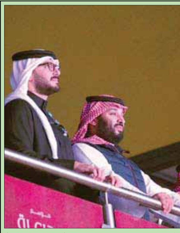
الأمير محمد بن سلمان يتابع «نزال الدرعية»