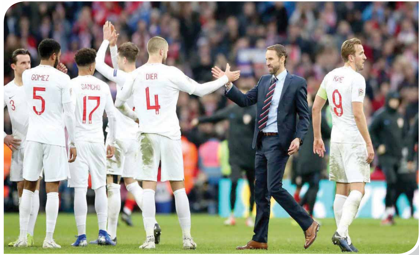
ساوثغيت غير من طريقة أداء المنتخب الإنجليزي بعد طول عناء، قبل مجيئه

بان الحرية المالية التي تتمتع بها اندية الدوري الممتاز في استيراد فيرجيل فان دايك أو نينغولو كونتي أينما اقتضت الضرورة، فوضت جهود لاعبين مهرة في فنون الدفاع من أبناء الوطن. وربما نجحت كرة جنوب لندن في تقديم جيل مبهر من المهارات الهجومية، لكنها أخفقت في إمداد ساوثغيت بمهارات مكافئة في خط الدفاع. فرصة الانضمام إلى المنتخب كانت في غاية الأهمية، فماذا كان جو غوميز أو فيكاو توموري سيتفوقان على جون ستونز وتيرون مينغنز في المنافسة على توفير شريك مثالي لهاري مغواير، الذي يبدو هو ذاته غير معصوم من الأخطاء، وما إذا كانت مهارات ترنت الكسندر أرنولد ستفوق على لخصات الإهمال الدفاعي التي يقع فيها من وقت لآخر، وما إذا كان ديكلان رايس وميسون ماونت بمقدورهما النضج بسرعة كافية لأن يبررا ضمهما إلى التشكيل الأساسي للمنتخب. على الأقل، بإمكان ساوثغيت التحلي بالصبر تجاه جادون سانشو وكالوم هودسون أودوي، فرغم أنهما لم يبلغا كامل نالتقهما بعد، فإنه كان من الحكمة منحهما