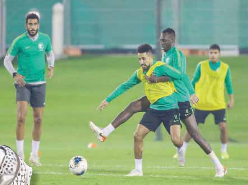
جانب من تدريبات المنتخب السعودي الأخيرة قبل النهائي اليوم

ورغم أن اللقب الأول يلوح في الأفق، فإن تعامل المدرب هيليو سوزا مع المباريات السابقة قد يوحى بأن التتويج لم يكن ضمن أولوياته. ومثل السعودية، دخلت البحرين البطولة بعد جدول مزدحم بمباريات تصفيات كأس