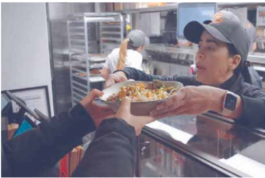
ماكولات بسيطة تعتمد على مبدأ «فيوجن»