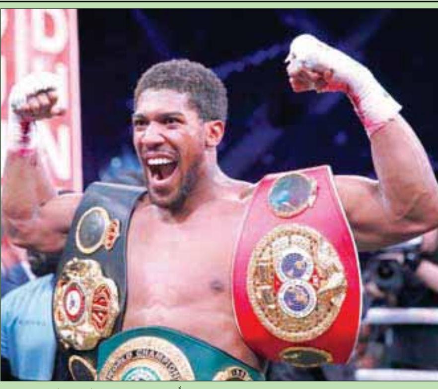
الملك البريطاني انتوني جوشوا بعد تتويجه بطلاً للعالم للوزن الثقيل