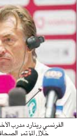
الدوحة، «الشرق الأوسط»

وعما إذا كان فوز الأخضر باللقب شيئاً معاكساً للتوقعات، قال رينارد: «المنتخب السعودي قبل بداية البطولة كان المرشح الأقوى أيضاً. لدينا فريق مميز وبعض اللاعبين فازوا للفوز مع الهلال بلقب دوري أبطال آسيا. المنتخب السعودي خاض أكثر من مباراة نهائية سابقة».