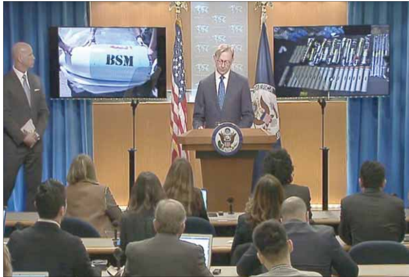
لقطة من فيديو المؤتمر الصحافي الذي جرى الكشف خلاله عن إحباط تهريب الأسلحة الإيرانية إلى الحوثيين في خليج عدن الأربعاء الماضي

التي استندت إليها تلك المخاوف أو عن أي جدول زمني للعمل العدائي المفترض أن إيران تتحضر له. يشار إلى أن طهران دأبت خلال السنوات الماضية على تزويد الجماعة الحوثية بالصواريخ والأسلحة والطائرات المسيرة على طريق شبكات تهريب بحرية وفق تقارير أممية ودولية. مسبقاً إن احتجزت القوات الدولية واليمنية في البحرين العربي والأحمر أكثر من شحنة أكبر مسؤول في البنتاغون، للصحافيين، أن لدى الولايات المتحدة مخاوف من سلوك إيراني محتمل، لكنه لم يكشف