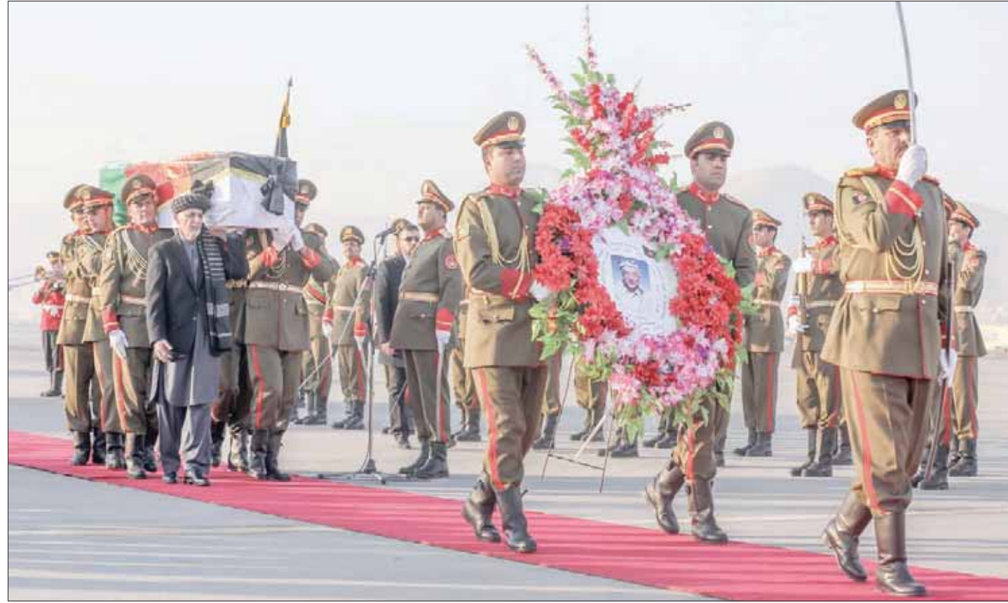
الرئيس الأفغاني أشرف غني يشارك في مراسم تأبين موظف الإغاثة الياباني القتيل تيتسو ناكامورا قبل تسفير الجثمان إلى طوكيو أمس

أشرف غني معهما في المكتب وفي حديقة في حفل التأبين، قال غني إن منغذي جريمة القتل «سيتم العثور عليهم ومحاسبتهم»، ووصف موظف الإغاثة الياباني ناكامورا بأنه «بطل أفغاني ضحى بحياته للنهوض بأحوال المحرومين». ولم تعلن أي جهة مسؤولة عن الهجوم، وذكرت هيئة الإذاعة اليابانية، في وقت سابق، أنه سيتم نقل جثمان الطبيب الياباني، مصحبة أسرته، اليوم (أمس) السبت، إلى بلاده.