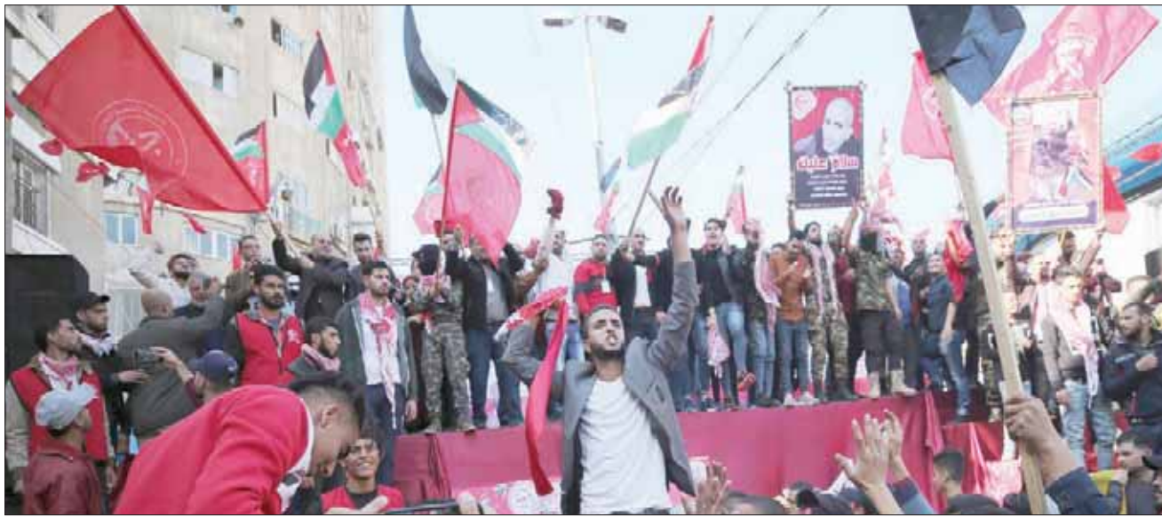
مسيرة نظمتها «الجبهة الشعبية لتحرير فلسطين» في غزة أمس بمناسبة مرور 52 عاماً على تأسيس الجبهة

صائب عريقات، إن قرار الكونغرس الداعم لحل الدولتين والرافض لسياسة الضم والاستيطان، ضربة قوية لمحاولات إدارة الرئيس ترمب شرعنة الاستيطان والضم. وقال عريقات في تعليقه على القرار: «نطالب بخطوات ملموسة لمنع إدارة الرئيس ترمب وإسرائيل من الاستمرار في مخالفة القانون الدولي وتدمير خيار الدولتين». والعلاقات بين المسؤولين الفلسطينيين والأميركيين شبه مقطوعة منذ نهاية 2017 عندما اعترف ترمب بالقدس عاصمة لإسرائيل. ويقول الرئيس الفلسطيني محمود عباس إنه يرفض دور الولايات المتحدة كوسيط للسلام وإنها يمكن أن تكون جزءاً من الية دولية إذا تراجعت عن قراراتها.