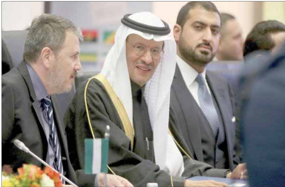
وزير الطاقة السعودي الأمير عبدالعزيز بن سلمان في اجتماع أوبك يوم الخميس الماضي

تربليون دولار التي حددها تسعير أسهمها في الطرح العام الأولي والتي سيبدأ تداولها في 11 ديسمبر. وأبلغ «رويترز»: «نعتقد أن قيمة الشركة أعلى كثيراً من 1,7 تريليون دولار»، مضيفاً أن «أرامكو» سقطت ضحية لتباطؤ أوسع في صناعة النفط خفضت قيمتها إلى أقل من تريليوني دولار، وهو الرقم الذي كان ولي العهد السعودي الأمير محمد بن سلمان قد استهدفه.