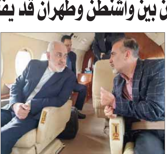
جواد ظريف يتحدث مع العالم الإيراني في الطائرة أمس

التسهيلات الخاصة بتبادل السجينين، فيما قالت الوكالة الرسمية الإيرانية، إن وزير الخارجية الإيراني محمد جواد ظريف، استقبل سليمان في زوريج التي قالت الوكالة إنها شهدت عملية التبادل. وأضافت