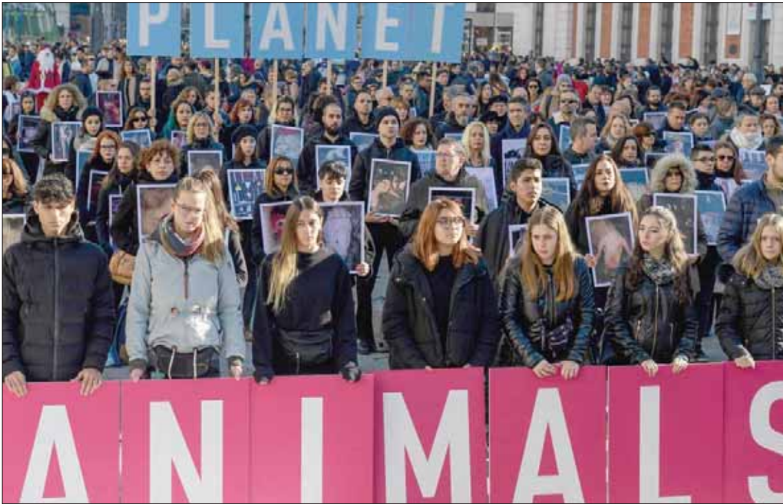
الشباب يواصلون احتجاجاتهم أمس في مدريد من أجل الضغط على الحكومات وحماية كوكب الأرض من التغيرات المناخية

الموقعة في عام 2015، وتتضمن التزامات الدول خفض انبعاثات غازات الدفيئة لوقف الارتفاع المطرد في درجة حرارة الكرة الأرضية. لكن بارديم عاد واعتذر في تغريدة على حسابه «تويتتر»، صباح أمس (الأحد)، قائلاً: «لا محل للشتيمة في أي خطاب أو حديث، اعتذر عن هذا الإنذاف المفرط الذي يضر بالرسالة البناءة التي نريد إيصالها، والتي هي وحدها محور نشاطنا والاهتماماً». وأضاف أن «القرآن» العلمية الدامغة حول تغير المناخ وتداعياته الكارثية لم تعد تسمح لأي كان أن يتجاهلها، خصوصاً المسؤولين عن اتخاذ التدابير التي يمكن أن توقفها».