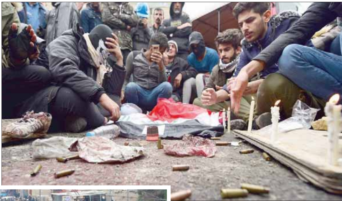
مظاهرون يضيئون الشموع في مكان سقوط قتلى من زملائهم وسط بغداد أمس

بغداد، فاضل الشمشي شهد العراق، أمس، موجة غير مسبوقة من الغضب نجمت عن المجزرة الجديدة التي نفذتها، ليل السبت، جماعات مجهولة، يُعتقد أنها تنتمي إلى فصائل مسلحة موالية لإيران، في ساحتي السنك والخلاني، ونهب ضحيتها عشرات القتلى والجرحى، ضمنهم ثلاثة مصورين صحافيين. وشهد العراق أيضاً، تنامي مشاعر الخوف من احتمالية اندثار البلاد إلى موجة من اللطم الداخلي، ومستويات جديدة من العنف، في ظل العجز الواضح الذي تبديه القوات الحكومية في ضبط الأوضاع ووقف ممارسات الفصائل المسلحة المنقطة، لا سيما بعد استهداف بطائرة مسيرة طال منزل زعيم التيار الصدري مقتدى الصدر بمنطقة الحنّانة في محافظة النجف.