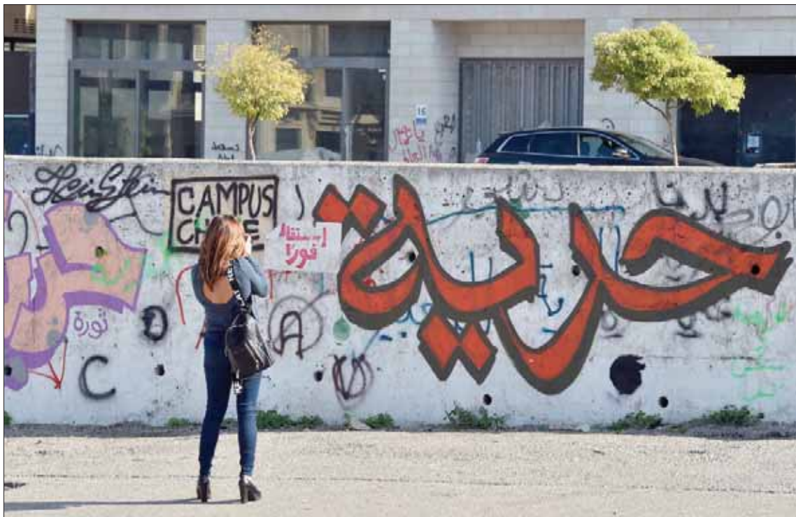
من الشعارات المرسومة على أحد الجدران وسط بيروت مع استمرار المظاهرات والأزمة الحكومية

وبعدما كان رئيس الحزب التقدمي الاشتراكي النائب السابق وليد جنبلاط، قد أعلن أنه سيقدّم أسماء شخصيات درزية غير حزبية للمشاركة في الحكومة، قال أمس، في ذكرى ميلاد كامل جنبلاط: «لا حل إلا بتشكيل حكومة تكون وفق أصول (الطائف) والدستور». وأضاف: «لا نريد دخول حكومة أضاحت الحد الأدنى من كل الأسس الدستورية التي يمارسها البعض حتى الآن». وفي الإطار نفسه، قال النائب في «اللقاء الديمقراطي» مروان حمادة: «لا أحد من أي فريق من وزير البلاط إلى الخليلين إلى ميشال عون، يستطيع أن يملئ علينا تركيبة مسقة، وترفض كل تعليق للحكومة قبل الاستشارات المرئية». ولفت إلى أن «شيء قد كتب ومن يعتقدون أنهم يستطيعون الكتابة نيابة عن الشعب مخلطون».