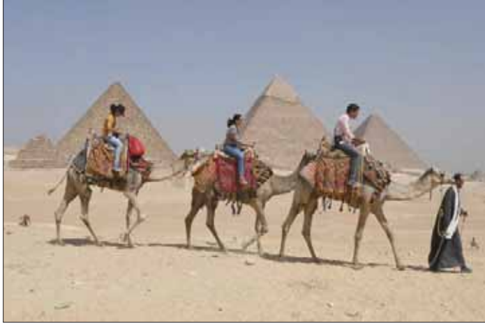
سياح أمم الأهرامات في منطقة الجيزة (أغب)

تحقيق نمو يتسم بالقوة والاستدامة والشمولية. ومن المقرر أن يجتمع وكلاء وزارات المالية ومحافظو البنوك المركزية لمجموعة العشرين مجدداً في فبراير (شباط) المقبل لمواصلة مناقشاتهم تحضيراً لاجتماع وزراء المالية ومحافظي البنوك المركزية لدول مجموعة العشرين المقرر عقده في مدينة الرياض خلال الفترة من 22 إلى 23 فبراير 2020.