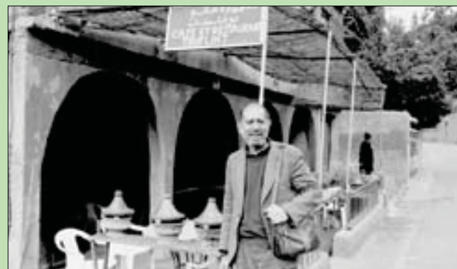
حلقة الفنان الكواتي الراحل مولاي احمد الجابري في ساحة جامع الفنا بداية التسعينات

يحدث الشاعر الصالحي عن بن إسماعيل، الإنسان والفنان، فيقول: «مد سعدت بالتعرف إلى بن إسماعيل، مدون من حقيقة مراكش، فصرت أرى البلد، أو مغاربة ساهموا بقطر وافر في المسار الفني والأدبي المغربي المعاصر...»