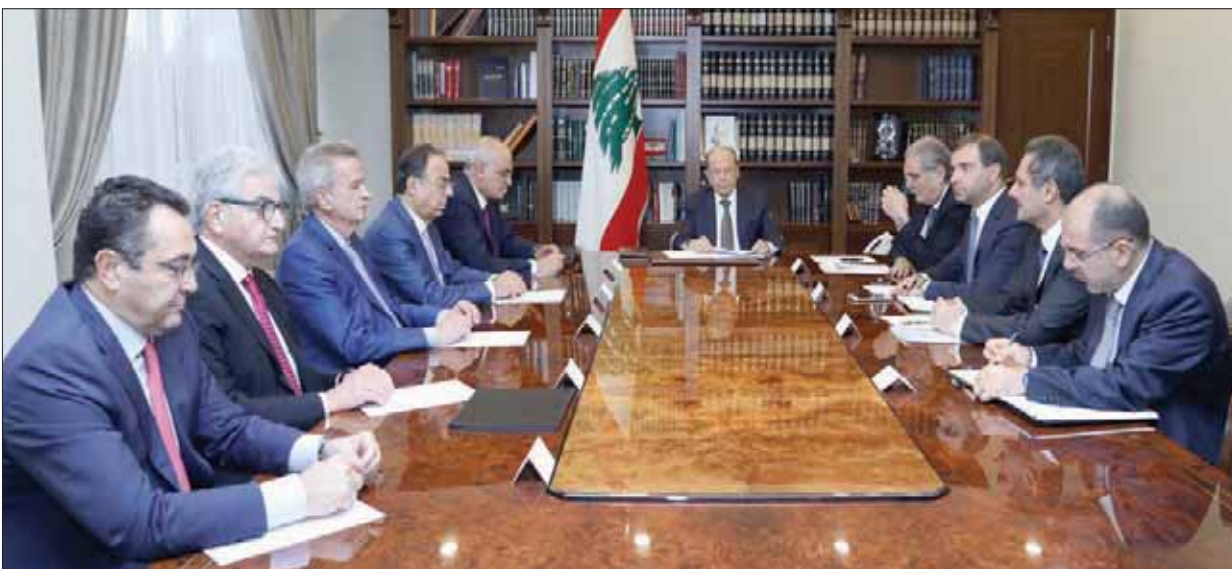
من الاجتماع المالي برئاسة الرئيس ميشال عون أمس (الاتي ونهرا)

استبعد مصدر وزاري بارز أن يشكل الاجتماع المالي - الاقتصادي، الذي عُقد أمس بدعوة من الرئيس ميشال عون، رافعة تدفع باتجاه خفض منسوب التآزم الذي يحاصر البلد على المستويات كافة، وقال «الشرق الأوسط» إنه سيكون نسخة طبق الأصل عن الاجتماع السابق الذي رعاه عون في بعثا، ولم يوقف التدهور، وإنما زاد من وطأة الأزمة المالية.