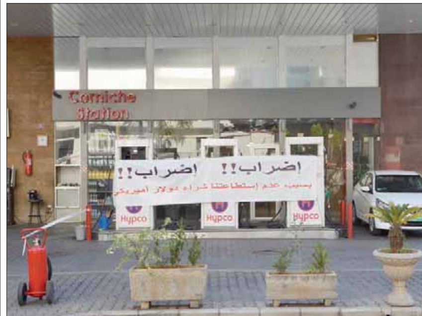
محطة بنزين مغلقة في بيروت احتجاجاً على سعر صرف الدولار (أ.ب.)

نفدت مادة البنزين من عدد من السيارات ما تسبب بانقطاعها في وسط الشوارع في بيروت، فيما قفز مواطنون آخرون إطفاء محركات سياراتهم في وسط الشوارع، اعتراضاً على إضراب نفذته محطات توزيع المحروقات لليوم الثاني على التوالي.