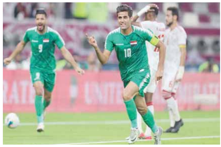
فرحة عراقية تكررت مرتين في شباك منتخب الإمارات

وعكف الجهاز الفني لـ «الأزرق» على دراسة الفريق العماني وأسلوب لعبه من خلال مشاهدة مباراة الأخير مع البحرين في الجولة الأولى والتي شهدت أداءً قوياً وحساسياً وفرصاً عدة للجانبين خاصة في الدقائق الأخيرة.