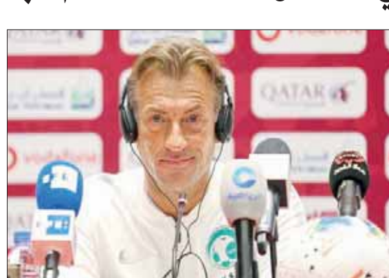
جانب من المؤتمر الصحفي لمدرب الأخضر رينارد

وعما إذا كان يسعى للفوز باللقب الأول في كأس الخليج بعد الأداء القوي أمام عمان،