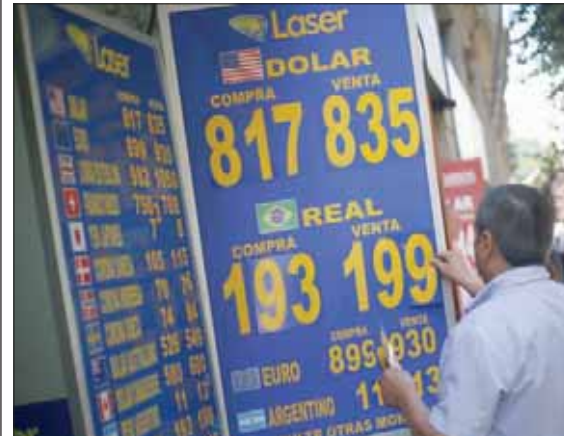
أحد الصيرافة يستبدل سعر العملة

رسم النقل بالمتر في العاصمة، حيث طالبوا حكومة الرئيس سيباستيان بينيرا بإجراء إصلاحات. وبعث الخميس عقدت الحكومة التشيلية اجتماعاً هو الأول مع النقابات في محاولة لإيجاد حل للأزمة الاجتماعية الخطرة المتواصلة منذ أكثر من أربعين يوماً والتي تُخبر قلق الأسواق وإطلاق أعضاء حكومة الرئيس المحافظ بينيرا ممثلي «منظمة الوحدة الاجتماعية» التي تضم منظمات نقابية واجتماعية الدعوات للاحتجاج، وبينها الوحدة المركزية للعاملين، أقوى نقابة في البلاد. وطالب المظاهرون الحكومة بزيادة الحد الأدنى للأجور. وتطالب النقابات بأن يرتفع الحد الأدنى للأجور من 301 ألف بيرو