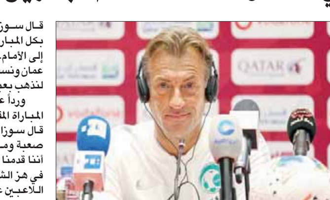
جانب من المؤتمر الصحفي لمدرب الأخضر رينارد

أنه يسعى اليوم لتحقيق الفوز أمامه، مشيراً إلى أنه يركز دائماً على فريقه بغض النظر عن هوية المنافس.