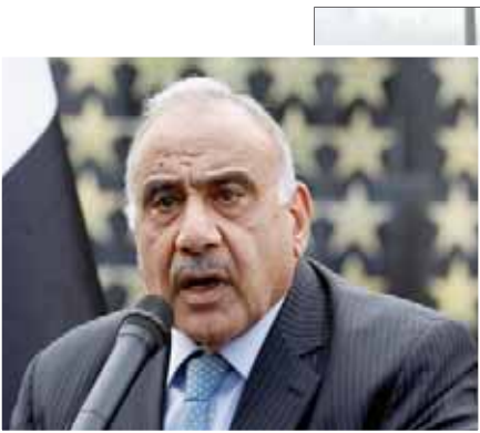
رئيس الوزراء العراقي عادل عبد المهدي

إلى ذلك أكد رئيس كتلة تحالف القوى في البرلمان العراقي محمد الكربولسي في تصريح لـ«الشرق الأوسط»، أن «تحالف القوى العراقية (بزعامة رئيس البرلمان محمد الطيوسي) سبق أن حذر عادل عبد المهدي من أن إصراره على سبف الدماء سيعجل من نهايته السياسية»، وأوضح الكربولسي أن «بصالح عبد المهدي هو انتخاب العملية السياسية، وبالتالي فإننا مع عدم بقاء هذه الحكومة التي تسببت في إراقة الدم العراقي».