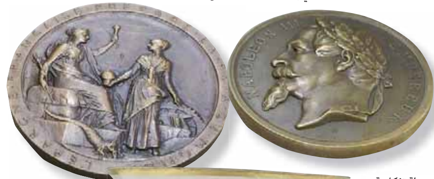
عملة تذكارية بمناسبة افتتاح القناة

استقدم الفنان الفرنسي خلال الفترة التي سبقت افتتاح قناة السويس، لوثائق الفعاليات باعماله الفنية، مع أنه كان معروفاً في زمنه بمساهماته الفنية في رسم شخصيات الروايات الشهيرة لكبار الأدباء