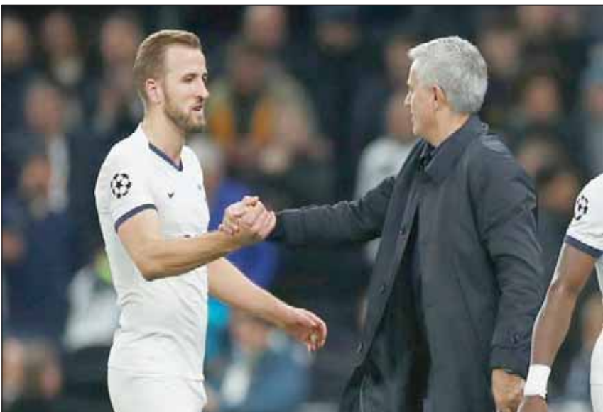
مورينيو يهنئ كين بادانغ والفوز على أولمبيكوس في دوري الأبطال

هي اللحظة التي أدركت فيها أنه لا يهتم بأسماء اللاعبين وشهرتهم، وبنجوم الفريق في غرفة خلع الملابس، فهو يتعامل مع جميع اللاعبين على قدم المساواة وبنفس الطريقة. كانت هذه هي اللحظة التي أدركنا فيها طبيعة شخصيته، وأعتقد أن لاعبي توتنهام سؤى يدركون ذلك أيضاً عندما يستمعون إلى المطالب التي سيطلبها من كل لاعب منهم. وعندما تسوء الأمور، فإن مورينيو يتعامل دائماً بشكل إيجابي، وأعتقد أنه سيحاول الاستفادة من هذه النقطة في توتنهام بعد تراجع نتائج الفريق بشكل ملحوظ في الفترة الأخيرة. لقد تحدثت إليه قليلاً خلال الأشهر القليلة الماضية عندما لم يكن يتولى تدريب أي نادٍ، وأعتقد أنه الذي لديه: إنه مدير فني يستعد للمباريات بشكل جيد للغاية. وعندما يدخل اللاعبون أي