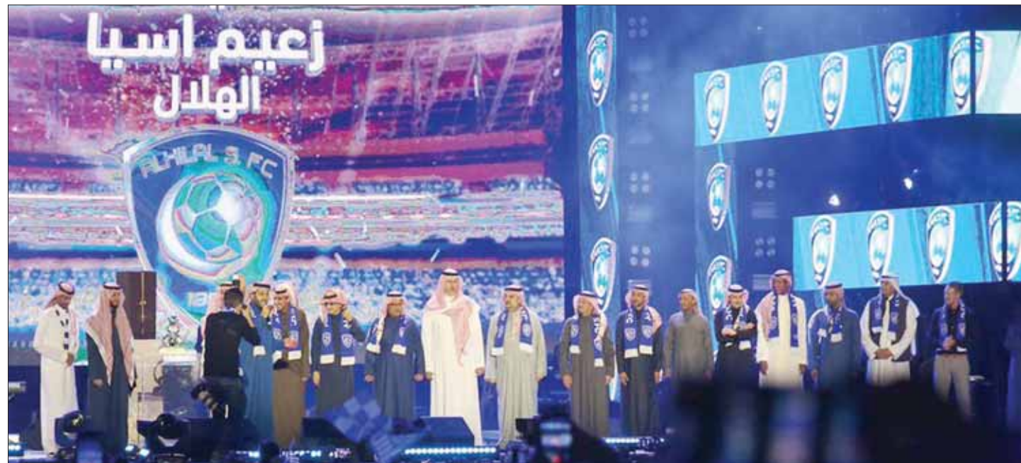
تركي آل الشيخ قدم شرفي ورؤساء نادي الهلال في الحفل الغنائي

كلمة أخيرة: غياب نجوم الهلال المؤثرين عن أولى مباريات الأخضر السعودي أمام الكويت في خليجي 24 كان مؤثراً... ومؤثراً جداً وكان شكل المنتخب غربياً وهزوزاً ومستغرباً وعليه أكثر من علامة استفهام وتعجب!