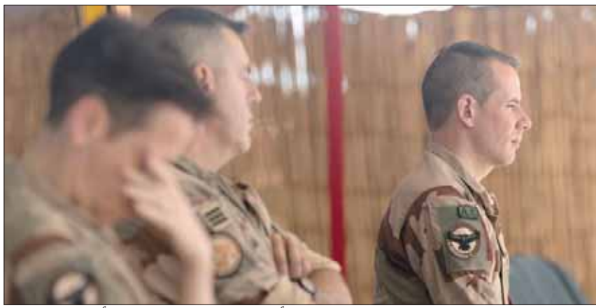
جنود فرنسيون في مالي بعد تشييع 13 جندياً من زملائهم لقوا حتفهم مؤخراً

يشكل تهديداً رئيسياً لأوروبا، وبالتالي يتعين على الأوروبيين أن يتحملوا مسؤولياتهم، ولا يتكفوا بالعدم السياسي. بيد أن الخيارات الفرنسية، إذا ما استبعد الانسحاب، ليست كثيرة، ويمكن الخيار الأول في زيادة الحضور العسكري الفرنسي لمواجهة استعادة المجموعات الجهادية لديناميتها. وهذا الخيار غير مؤكد لأسباب إنسانية ولوجستية ومادية. والثاني تحويل الحضور العسكري الفرنسي إلى أوروبي؛ لكن هذا يحتاج لموافقة الأوروبيين. وحتى الآن ليس في مالي سوى عدد مئات من الدنماركيين و150 عسكرياً ألمانيا لتدريب القوات