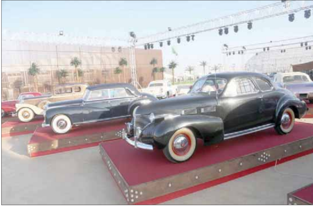
يضم المعرض سيارات كلاسيكية تعود إلى بدايات القرن العشرين