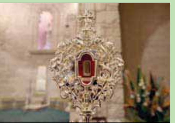
قطعة من مزود المسيح معروضة في كنيسة سيدة السلام في القدس

كنيسة سانتا ماريا ماجوري في روما. وأوضحت وكالة «رويترز» أن هذا الجزء وصل إلى القدس لعرضه على الجمهور لفترة وجيزة قبل نقله إلى بيت لحم مسقط رأس لإطاح موسم الاحتفال بعيد الميلاد رسمياً. وكان راعي كنيسة بيت لحم قد تسلم هذا الأسبوع جزءاً صغيراً من مزود خشبي كان محفوظاً في