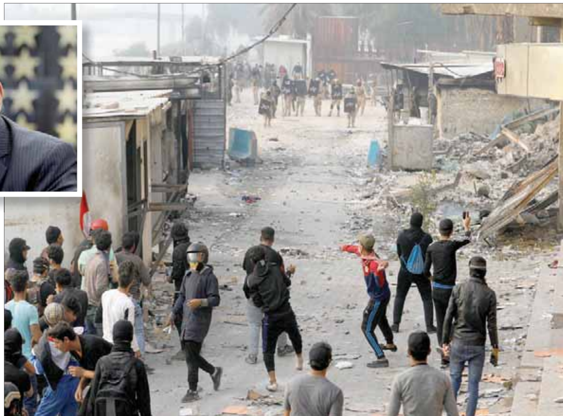
مواجهة بين الجيش والمحتجين في بغداد

الوطني، إيداع علاوي إنه قرر الانسحاب من العملية السياسية بشكلها الحالي والعمل على تقويضها وإعادة بنائها سلمياً