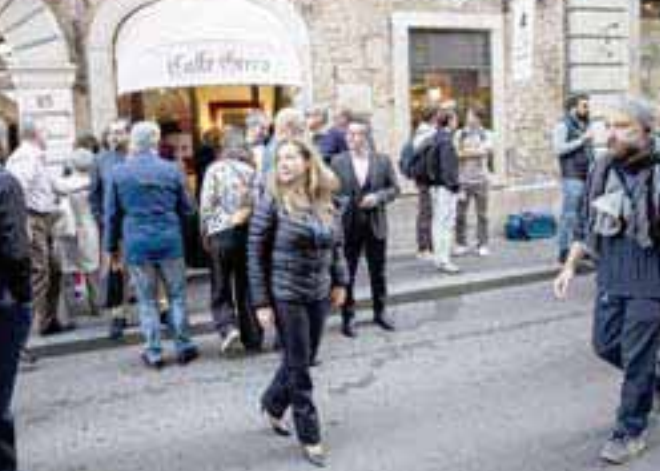
مقهي غريكو في أشهر ميادين العاصمة الإيطالية مهدد بالإغلاق