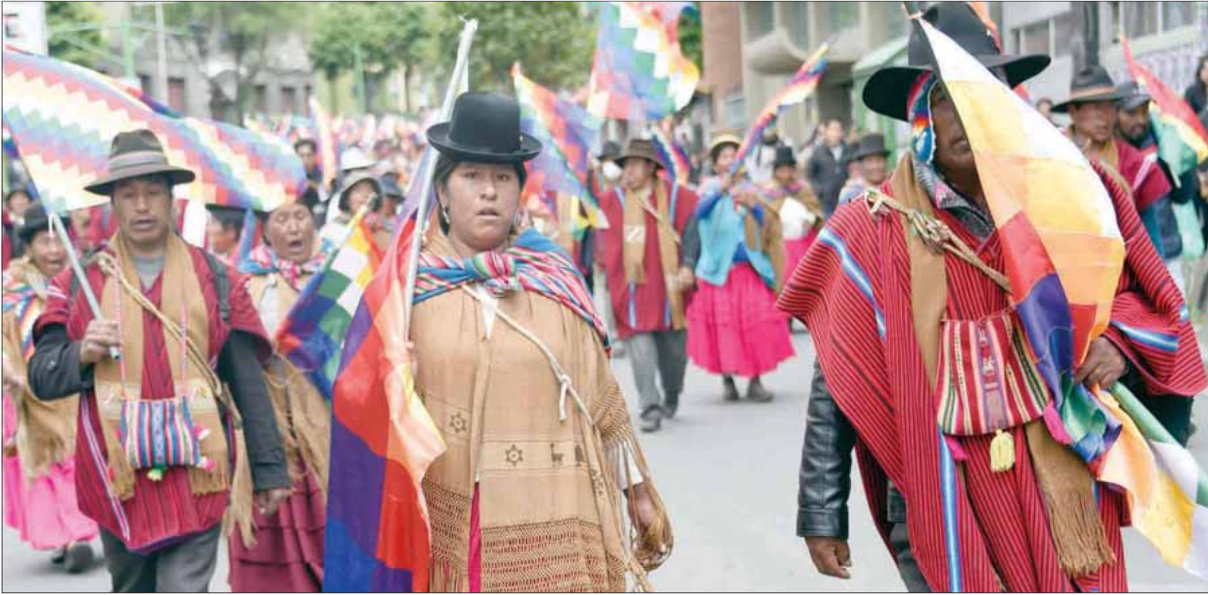
مديريه: شوقي الرئيس

في الثاني عشر من شهر أكتوبر (تشرين الأول) عام 1492، أي بعد سبعة أشهر على سقوط غرناطة، وصل البحار كريستوف كولومبوس إلى شواطئ جزيرة غواناهاني، ونزل في الأراضي التي أصبحت تعرف فيما بعد بـ«أميركا».