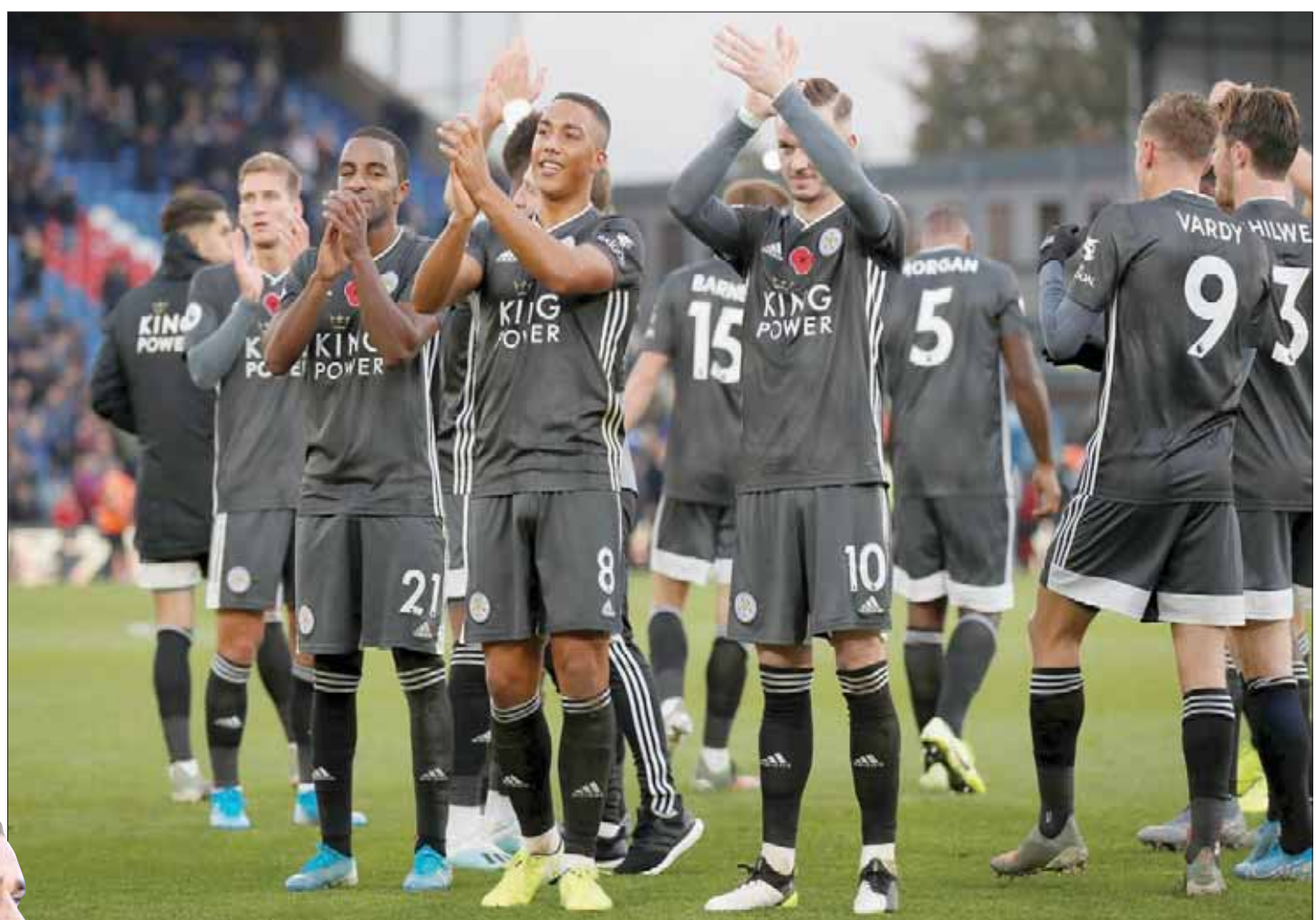
ليستر يحتل وصافة الدوري الإنجليزي ويبحث عن الانتصار السادس على التوالي

وكان برشلونة يريد أن يكون غريزمان مكملاً للثنائي لويس سواريز وليونيل ميسي في الهجوم، لكنه حتى الآن لم يثبت أهمية وجوده مع الفريق. ولا يتناسب غريزمان مع طريقة فريق برشلونة، حيث إن مركزه المفضل ك مهاجم ثان ليس موجوداً في برشلونة، ولا يستخدم. وخلال مباراة الأربعاء التي فاز بها برشلونة على بوروسيا دورتموند الألماني (3-1) في دوري أبطال أوروبا، وتأهل الفريق المستحق لدور الستة عشر، صنع ميسي الهدف الثالث الذي سجله غريزمان، ليسجل أول أهدافه في آخر 6 مباريات. وأوضح سواريز عقب المباراة: «أقدم انطوان أداء رائعاً، حظي بفرص وسجل هدفاً؛ هذا مهم لتفقتنا». وأبرزت كلمات لويس سواريز قلق لاعبي برشلونة من تكيف مهاجم أتليكو مدريد السابق قبل العودة مرة أخرى للمعب واندا ميتروبوليتانو. وشارك غريزمان كبديل أمام دورتموند، بعد إصابة عثمان ديمبلي الذي سيغيب عن لقاء أتليكو، وهو الذي يؤكد