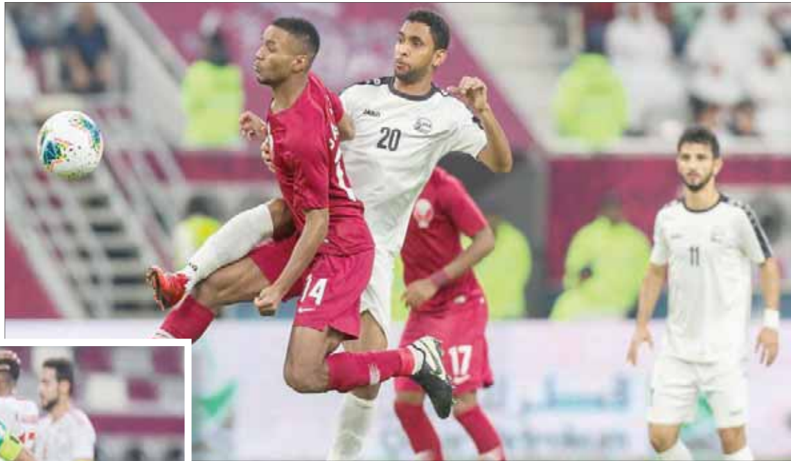
جانب من مباراة قطر واليمن أمس

يدخل المنتخب السعودي للقاء بقيادة مدربه الفرنسي هيرفيه رونار وهو يطمح في تعويض الخسارة القاسية أمام الكويت 3 - 1 وفي الوقت نفسه الإبقاء على آماله في التأهل إلى الدور نصف النهائي، مدركاً أن الخسارة تعني خروجه من دائرة المنافسة مبكراً.