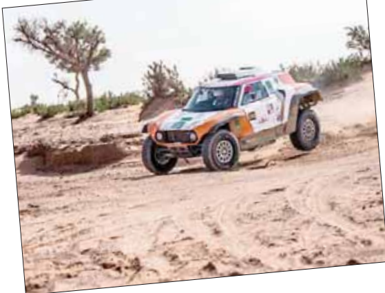
جانب من منافسات رالي الرياض أمس

الله - ومتابعة مباشرة من الهيئة العامة للرياضة برئاسة الأمير عبد العزيز بن تركي الفيصل، مُشدراً إلى أن عدد المشاركين في هذا الرالي يُعتبر أكبر مشاركة في تاريخ راليات المملكة، وهذا الأمر يُعطينا التفاؤل والأمل بنجاح استضافتنا لحادث عالمي كبير وهو رالي داكار، الذي تستضيفه البلاد خلال شهر يناير (كانون الثاني) المقبل، وستكون نقلة نحو العالمية لرياضة السيارات بالمملكة، مُقدّماً شكره وتقديره لأمير منطقة الرياض على دعمه لهذا الحدث.