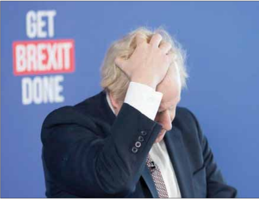
رئيس الوزراء البريطاني أكد أن بلاده ستغادر الاتحاد الأوروبي إذا فاز حزب المحافظين

المحافظين في حملته حيث قال «أفضل شيء» يمكن فعله عندما يكون هناك أصدقاء وحلفاء مقربون مثل الولايات المتحدة وبريطانيا هو عدم تدخل أي جانب في انتخابات الجانب الآخر». ولم يأت ترمب بنفسه عن الخوض في السياسة البريطانية خلال زيارته السابقة بما في ذلك انتقاده لسياسة رئيسة الوزراء السابقة تيريزا ماي بشأن انفصال بريطانيا عن الاتحاد الأوروبي. وصرح في أكتوبر (تشرين الأول) بأن زعيم حزب العمال المعارض جيريمي كوربين سيكون اختياراً «سيئاً جداً» لبريطانيا وأنه ينبغي على جونسون إبرام اتفاق مع نايجل فيراج زعيم حزب بريكت. واستغل كوربين لإشادة ترمب بجونسون للهجوم على لندن، «الشرق الأوسط» يخشى زعماء بارزون في حزب المحافظين أن يتفوه الرئيس الأمريكي دونالد ترمب خلال زيارته التي تستمر يومين لحضور قمة حلف شمال الأطلسي في لندن، بما قد يؤثر سلباً على حملتهم. ولهذا فقد طالبه علناً رئيس الوزراء بوريس جونسون بأنه من الأفضل ألا يتدخل في الانتخابات العامة التي ستجرى في 12 ديسمبر (كانون الأول) لأن ذلك سيكون له انعكاسات سلبية على حملة حزب المحافظين الذي يتقدم على خصمه العمالي بما لا يقل عن 12 نقطة مئوية. وقال جونسون «ما لا تفعله عادة كحلفاء وأصدقاء مقربين هو التدخل في الحملات الانتخابية لبعضنا البعض».