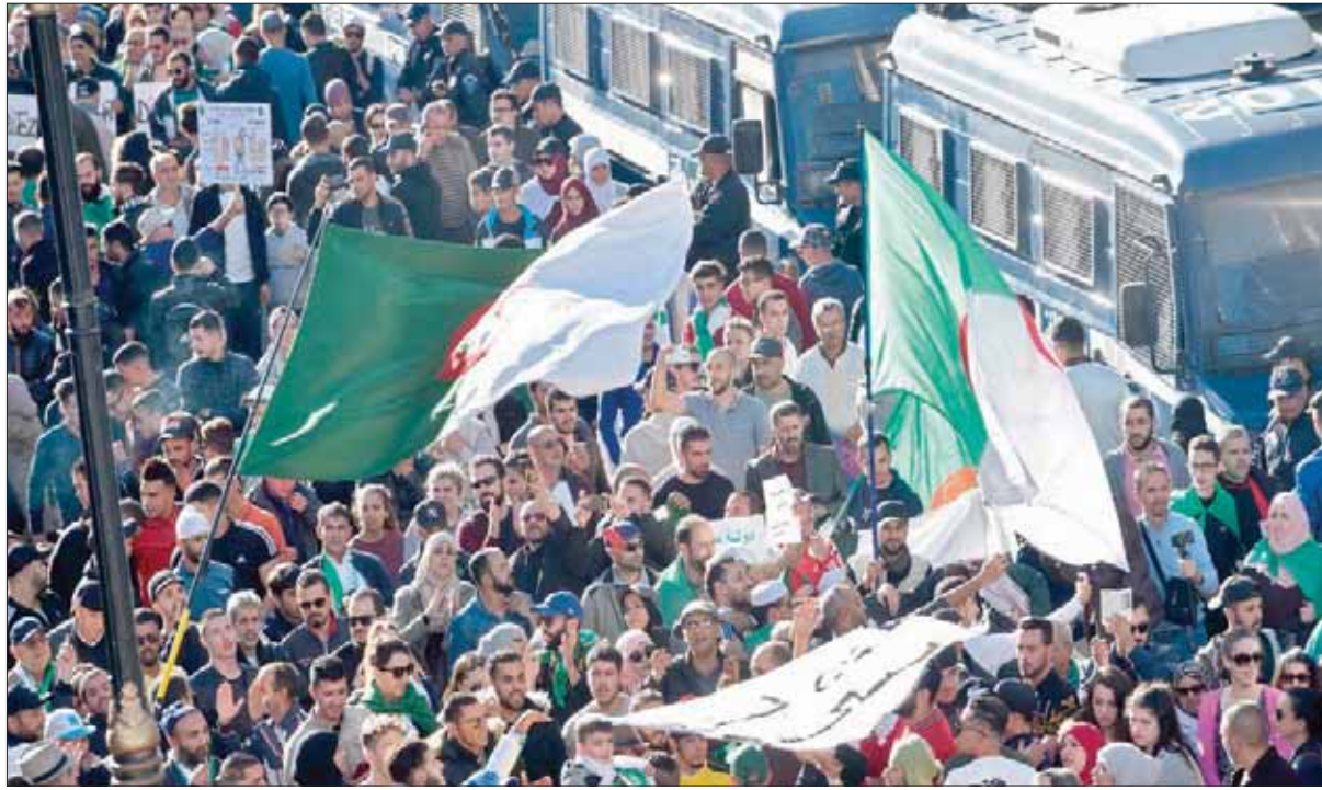
جانب من المسيرات الشعبية الراضة للانتخابات وسط العاصمة الجزائرية أمس

في غضون ذلك، أعلنت النقابة المركزية تنظيم مظاهرة كبيرة اليوم بأشهر ساحات الحراك وسط العاصمة، وذلك بهدف دعم قائد الجيش، والتأكيد بالراحة أصدرها البرلمان الأوروبي حول الوضع في الجزائر. ويرتقب أن تحشد النقابة