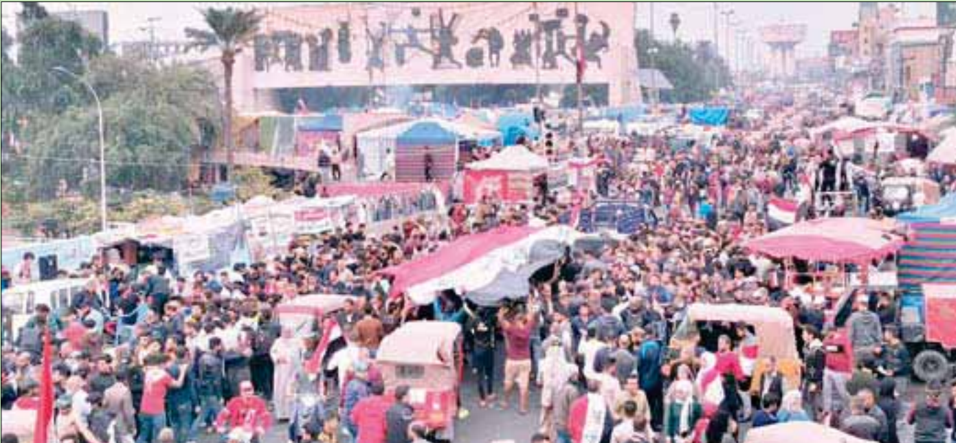
محتجون في ساحة التحرير ببغداد حيث عمّت الاحتفالات أمس إثر إعلان رئيس الوزراء عادل عبد المهدي نيته الاستقالة