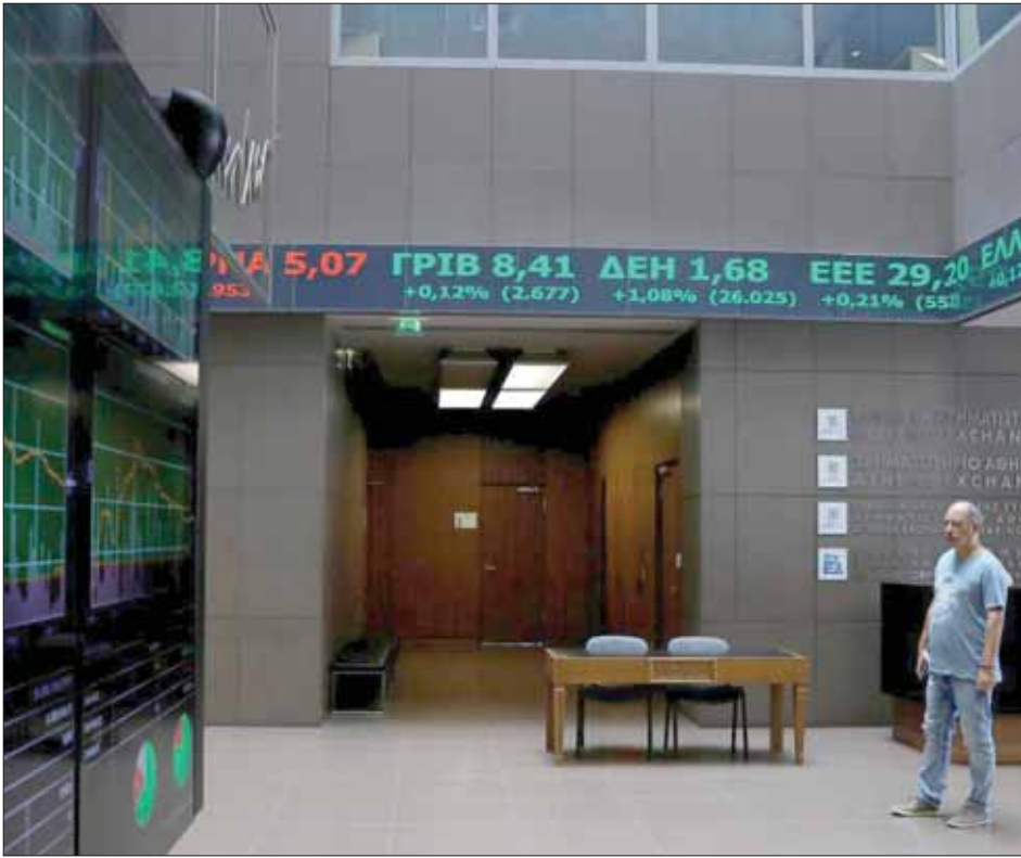
رجل ينظر إلى لوحة أسعار الأسهم داخل مبنى في بورصة أثينا

وبالعودة إلى سوق السندات اليونانية، فإن العوائد تنخفض، أي أن الثقة بتلك الأوراق المالية ترتفع، في موازاة تنفيذ الحكومة التزاماتها بالسداد، إذ سددت الأسبوع الماضي 2,7 مليار يورو (3 مليارات دولار) لصندوق النقد الدولي. ومع توالي الالتزام بالدفوع تخفض الفوائد التي تدفعها الحكومة لخدمة دينها العام. وتشير معطيات الأسواق إلى أن عوائد سندات استحقاق 10 سنوات انخفضت إلى 1,3 في المائة، وسندات استحقاق 5 سنوات إلى 0,36 في المائة. وهذه المعدلات هي بين الأدنى تاريخياً، ما يعني أن «الأنهار المالي ليس نهاية العالم، وبالإصلاحات الجدية تعود الثقة بالدول مهما كانت درجة تعثرها كارثية»؛ وفقاً لمحلل يجعل مع وزارة المالية اليونانية.