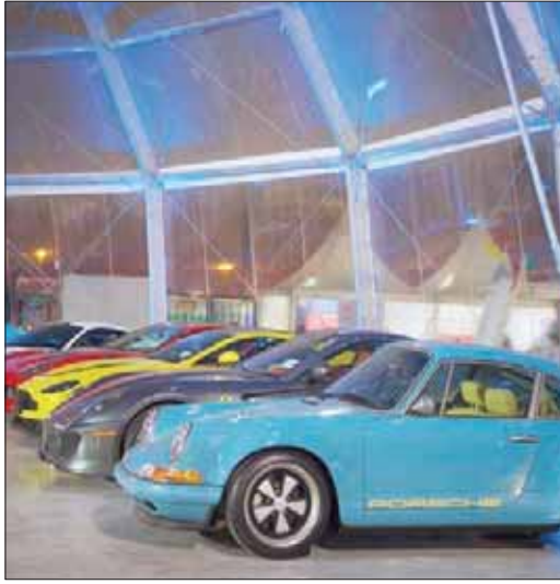
لقطة من المعرض لعدة موديلات