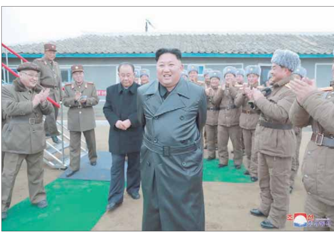
أعرب الزعيم كيم جونج أون عن «رضاه الكبير عن نتائج الاختبار» الأخير (رويترز)

وأضافت المحللة في الموقع المتمركز في سيول وتخصص في نشر معلومات وتحليلات عن كوريا الشمالية أن «بيونغ يانغ تمتلك كمية كافية من الأسلحة للقيام باختبارات هذه السنة وحتى في 2020 إذا رغبت في ذلك».