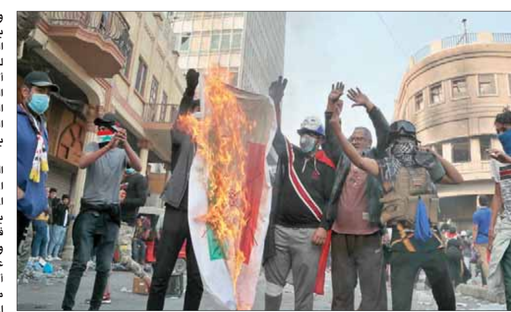
محتجون يرقون علماً إيرانياً في بغداد

وإلى جانب حملة المقاطعة الشعبية للمنتجات الإيرانية، يشير بعض المرابطين إلى مساهمة إيقاف المعابر الحدودية بين البلدين، أو انخفاض حركتها إلى مستويات غير مسبوقة، نتيجة الاحتجاجات العراقية، في الأضرار والتأثير على عمليات التبادل التجاري وغيره بين العراق والبرازيل وأستراليا وغيرها إلى غير صالح العراق دائماً، باعتباره بلداً مستهلكاً وغير منتج للبضائع