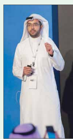
جانب من فعاليات الموسم الماضي (الشرق الأوسط)

ويأتي إطلاق النسخة الثالثة من «مسك 500» في أعقاب النجاح الذي حققته النسخة الثانية من المسرعة في دعم 19 شركة ناشئة من عدة دول، على رأسها السعودية والإمارات والبحرين والأردن ومصر، وفي عدة قطاعات اقتصادية منها التوظيف، والتجزئة والتجارة الإلكترونية، وتخطيط الموارد المؤسسية، والأطعمة، والأزياء وغيرها. كما أسهم الدعم المقدم في الدورة الأولى من المسرعة في تعزيز احترافية رواد تلك المشاريع، وتمكينهم من مضاعفة إيراداتهم الشهرية بنسبة تصل إلى 400 في المائة، وخلق وظائف تجاوزت 50 وظيفة، وتوسيع نطاق مشاريعهم الاستثمارية في أسواق المنطقة.