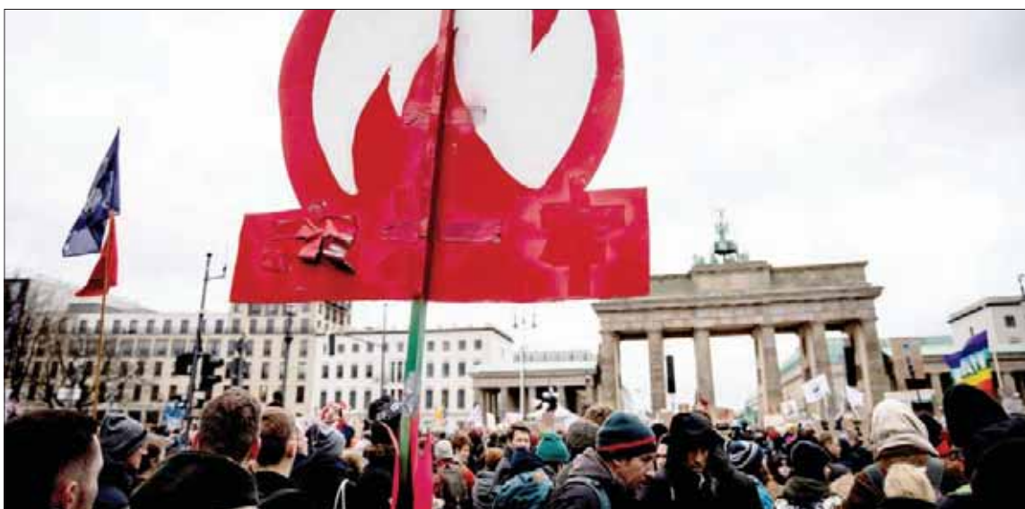
تجمع عشرات آلاف المتظاهرين أمام بوابة براندنبورغ التاريخية في برلين أمس

على خفض انبعاثاتها. ووعدت دول الشمال برفع التمويل إلى 100 مليار دولار سنوياً بحلول 2020. لكن دول الجنوب تطالب بتسريع المفاوضات حول تمويل «الخسائر والأضرار» التي قدرتها مجموعة من المنظمات غير الحكومية مؤخراً بـ300 مليار دولار سنوياً في 2030. وتطالب بعض الدول بتطبيق آلية تمويل محددة قد تتم تغذيتها مثلاً بضريبة على بطاقات السفر للرحلات الدولية، بحسب مراقبين.