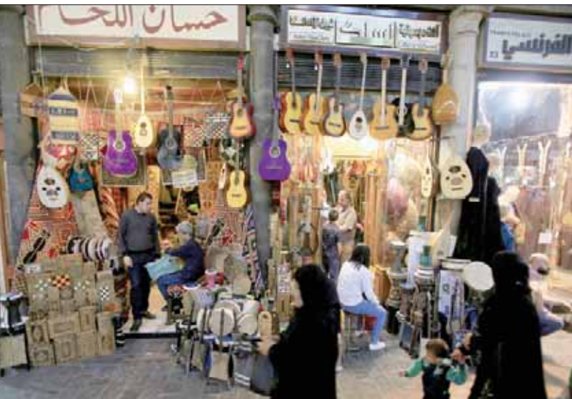
سوق الحميدية في دمشق القديمة أمس

ومع حلول فصل الشتاء، عادت أزمة الطاقة والوقود لتتجدد في سوريا، مع ازدياد الطلب على الغاز المنزلي والكهرباء لعدم توفر مادة المازوت اللازمة للتحفئة. ولم تتمكن الحكومة من توزيع الكمية التي وعدت بتوزيعها من المازوت بأسعر المدعوم على