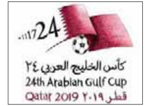
الدوحة، الشرق الأوسط

أخر ثلاث مباريات بينهما انتهت جميعها لصالح «الأبيض».