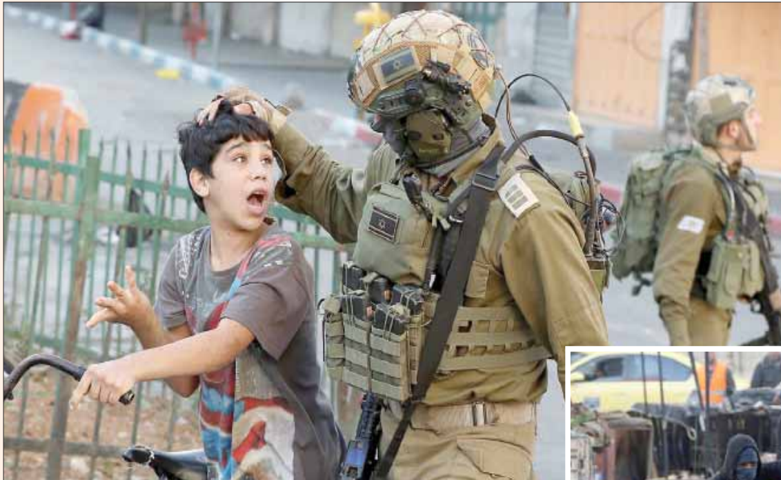
جندي إسرائيلي يعتقل صبياً فلسطينياً في الخليل أمس وفي الإطار شاب يستعد لرمي الحجارة على قوات الاحتلال