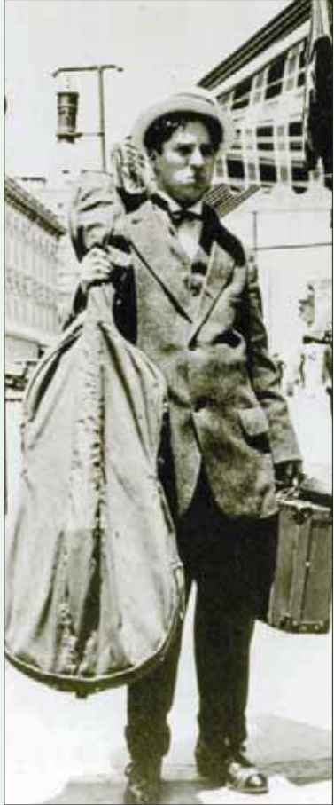
باريس، «الشرق الأوسط»

اسمه الشائع بين الفرنسيين هو «شارلو»، اختصاراً لشارلي شابلين. وهم على موعد معه خلال الشتاء الحالي من خلال معرض في متحف الموسيقى. ويترافق المعرض مع الفعاليات التي تقام لتكريمه في مقر الأوركسترا الفيلهارمونية في باريس. وبخلاف التكريمات التي أقيمت لهذا الممثل المولود في لندن، الأميركي النشيط، السويسري الإقامة والعالمية الشهيرة، فإن المعرض الباريسي يحمل عنوان «الرجل الأوركسترا».