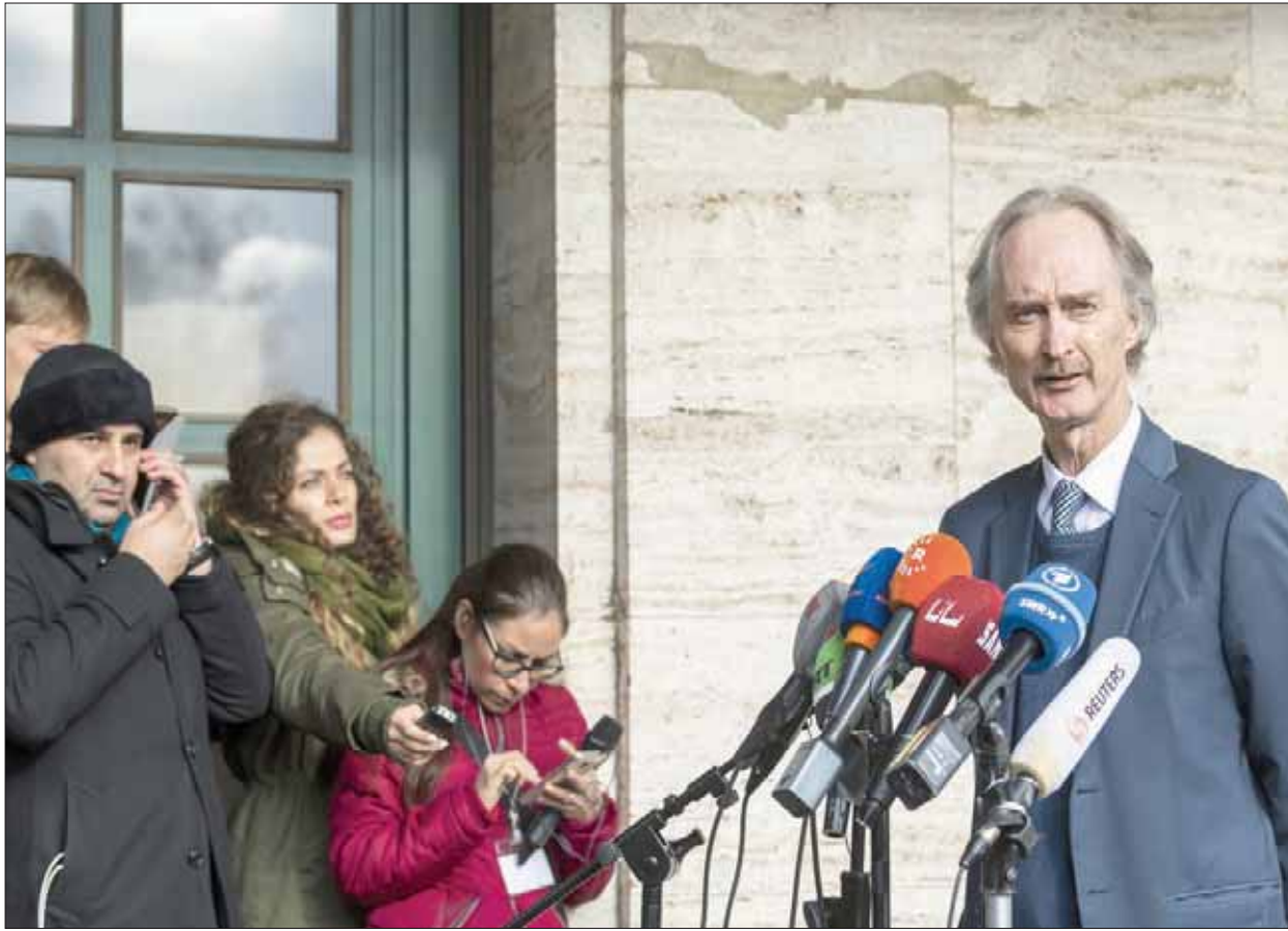
المبعوث الأممي غير بيدرسن في مؤتمر صحفي في جنيف أمس

وأضاف أن «وفد المعارضة سيتمسك بتنفيذ القواعد