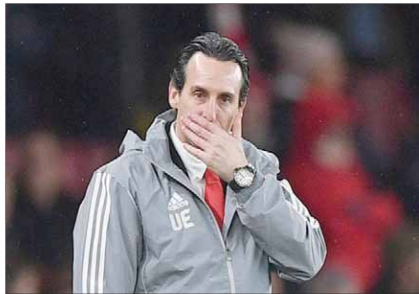
إيمري والهزيمة الخميس في الدوري الأوروبي (أ.غ.ب)

توتنهايم اللندني عن الأرجنتيني ماوريسيو بوكيتينو وتعيين البرتغالي جوزيه مورينيو بدلا منه. بدوره، لعب ليونغر (42 عاما) في العهد الذهبي لأرسنال مع فينغر إلى جانب 80 مليون يورو. وأهدر الفريق بركامب. وحمل الوانه بين 1998 و2007 محررا لقب الدوري في 2002 و2004 والكأس في ثلاث مناسبات، عندما كان أرسنال أبرز منافسي مانشستر يونايتد ومدربه الأسطوري السير الإسكو تلتندي اليكس فيرغسون.