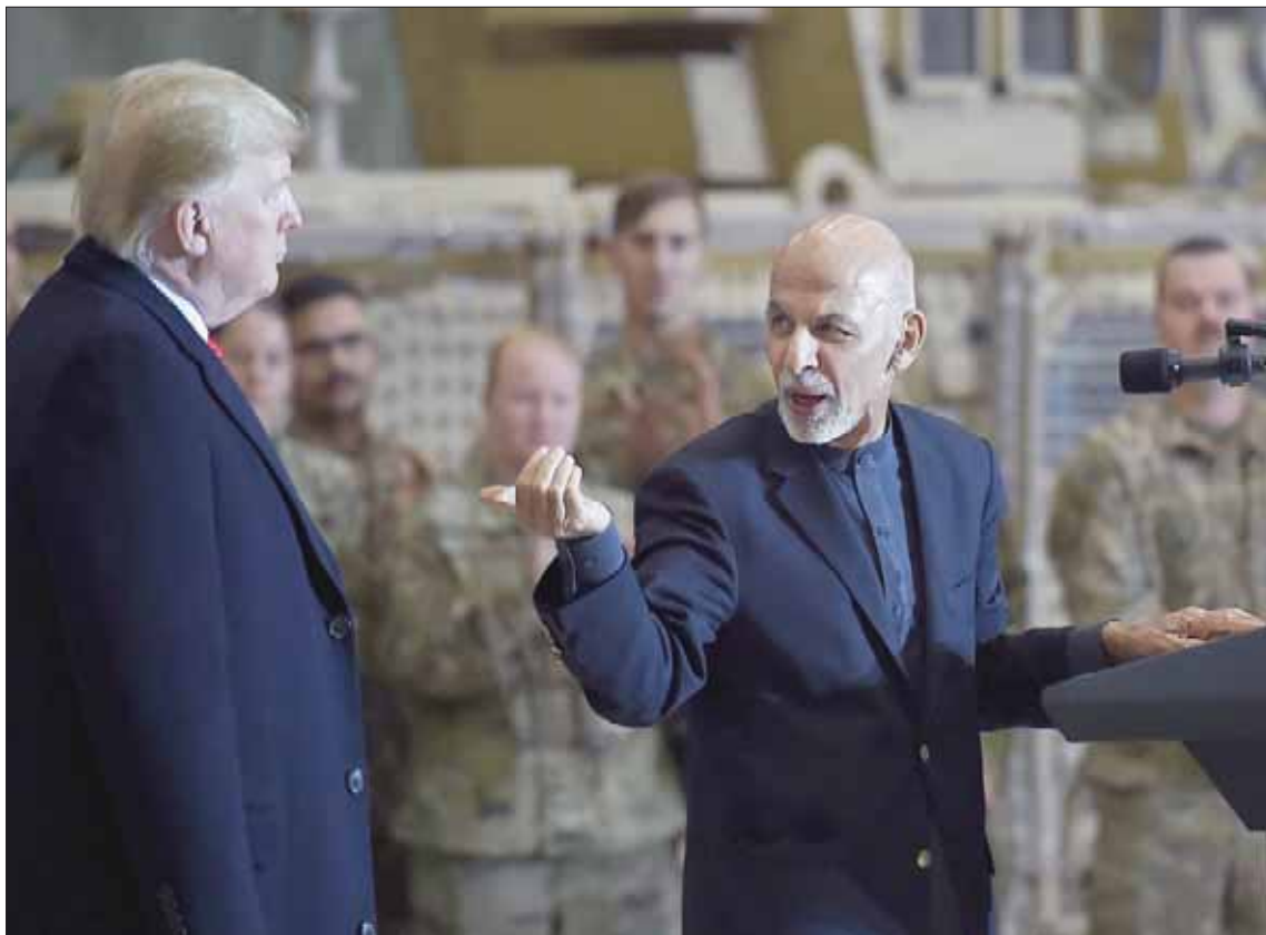
الرئيس أشرف غني مع نظيره الأميركي ترمب في قاعدة باغرام بأفغانستان

كبار موظفي البيت الأبيض، لكن زوجته ميلانيا لم ترافقه. واستقل ترمب طائرة عسكرية من منجعه الخاص في فلوريدا، حيث يقضي عطلة عيد الشكر، واستغرقت رحلته 16 ساعة. وكان نائب الرئيس الأميركي مايك بيس قد قام بزيارة مشابهة إلى العراق قبل أيام. ويسعى الرئيس ترمب إلى سحب الجنود الأميركيين من أفغانستان، غير أن الجنرال مايك ميلي رئيس أركان الجيوش الأميركية الجديد قال أخيراً خلال جولة له في دول المنطقة إن القوات الأميركية ستبقى لسنوات أخرى. واعترف ترمب بأن عدد القوات الأميركية يقل «بشكل كبير» لكنه لم يذكر أعداداً محددة.