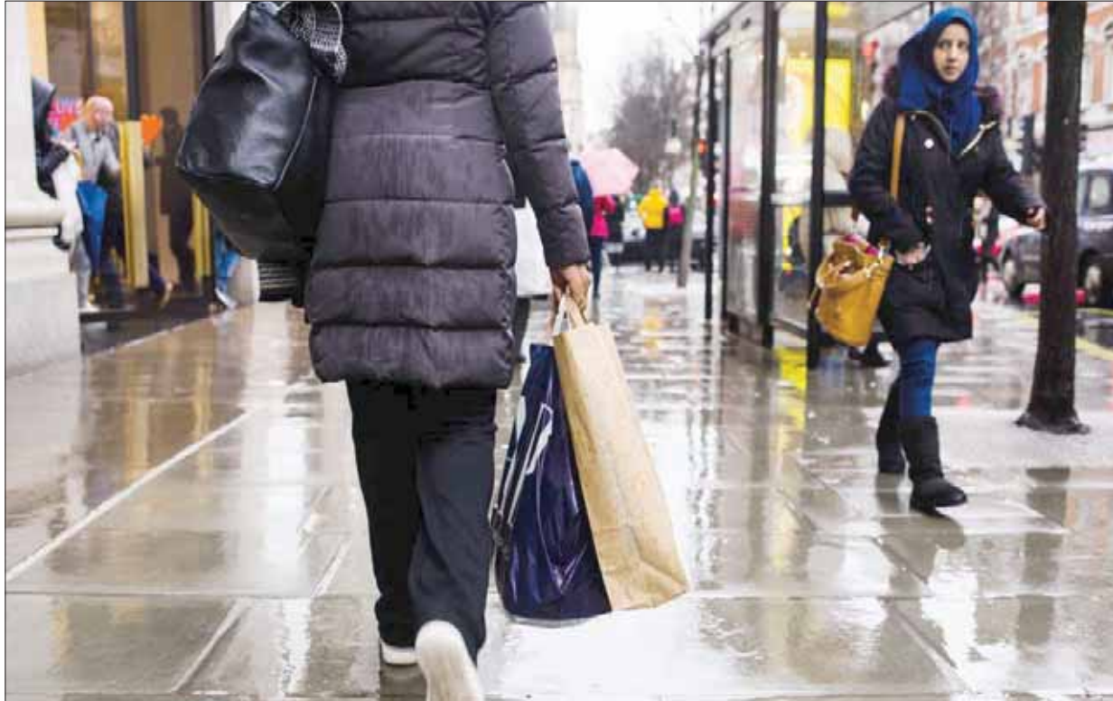
متسوقة تحمل حقائب في شارع أكسفورد في لندن بالمملكة المتحدة

وأفاد العسيس بأن ميزانية الأردن لعام 2020، البالغ حجمها 9,8 مليار دينار (14 مليار دولار) التي أقرتها الحكومة يوم الأربعاء، تتوقع زيادة 10 في المائة في الإيرادات من