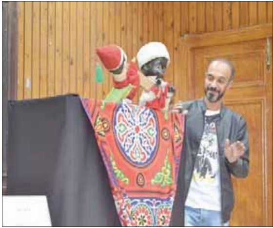
الخروج بعروض لفصائل غير معتادة