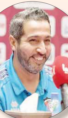
الدوحة، الشرق الأوسط

الأعذار بعد كل مباراة يخفق فيها مثلما حدث أمام بنجلاديش والبحرين، نفى كومان أن يكون قدم أي أعذار من قبل. وعن كيفية تعامله مع الضغوط الإعلامية، قال كومان: «لا أعاني من أي ضغط واللاعبون يقدمون أداء جيداً، لم يتوقع أحد هزيمة المنتخب القطري في الافتتاح ولكن البطولة صعبة منذ دقيقتها الأولى، ما أفقدناه في المباراة الأولى هو القدرة على ترجمة الفرص لأهداف».