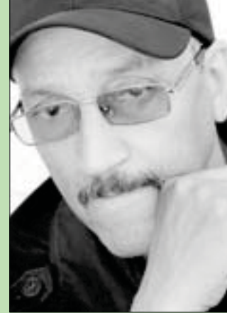
الفنان المغربي أحمد بن إسماعيل