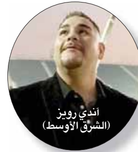
أندري رويز

أبدي بط العالم في الملاكمة للوزن الثقيل المسيكي أندري رويز إعجاباه الكبير بميدان الدرعية، الذي سيستضيف الرالي التاريخي المرتقب الذي سيجعله بخصمه البريطاني أنتوني جونسوا في 7 من ديسمبر (كانون الأول) المقبل، وقال أندري رويز أثناء زيارته للميدان الذي يتسع لـ 15 ألف متفرج ويحتضن إلى جانب القبة المرتقبة 4 نزالات عالمية أخرى في الوزن الثقيل: «سيكون نزلاً كبيراً، وسأكتب التاريخ هنا، أنا مندهش من كيفية بناء هذا الميدان