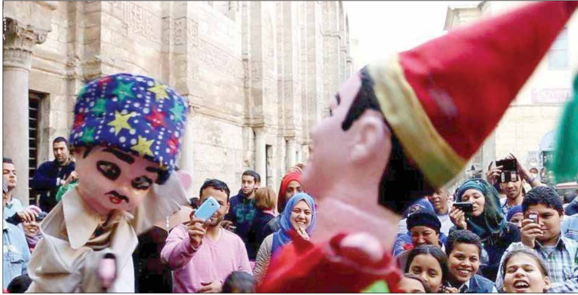
عروض الأراجوز تحمل في غالبيتها رسائل تعليمية أو تربية أو اجتماعية