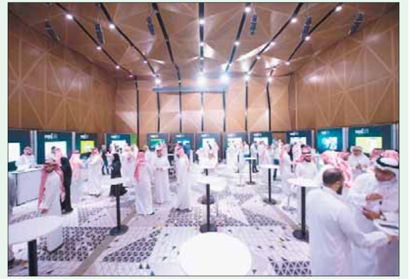
مسرعة «مسك 500» ستضم برامج تدريبية وورش عمل

من «مسك 500» إلى تقديم طلبات الالتحاق عبر الرابط التالي: www.misk.500.co ، وذلك قبل نهاية يوم السبت المقبل.