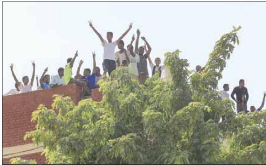
طلاب سودانيون يحتجون على خطبة الجمعة كان يلقيها أحد رموز النظام السابق

أجازت الحكومة السودانية في وقت متأخر من مساء أول من أمس، قانون اجتثاث «نظام الإنقاذ الوطني» السابق، الذي حكم البلاد لثلاثة عقود، يتضمن تفكيك «حزب المؤتمر الوطني»، الحاكم برئاسة الرئيس المخلوع عمر البشير، ومصادرة دوره وممتلكاته لصالح الدولة، وشرطه من سجل الأحزاب في البلاد، وحل واجهاته النقابية والسياسية والاقتصادية والاجتماعية والثقافية.