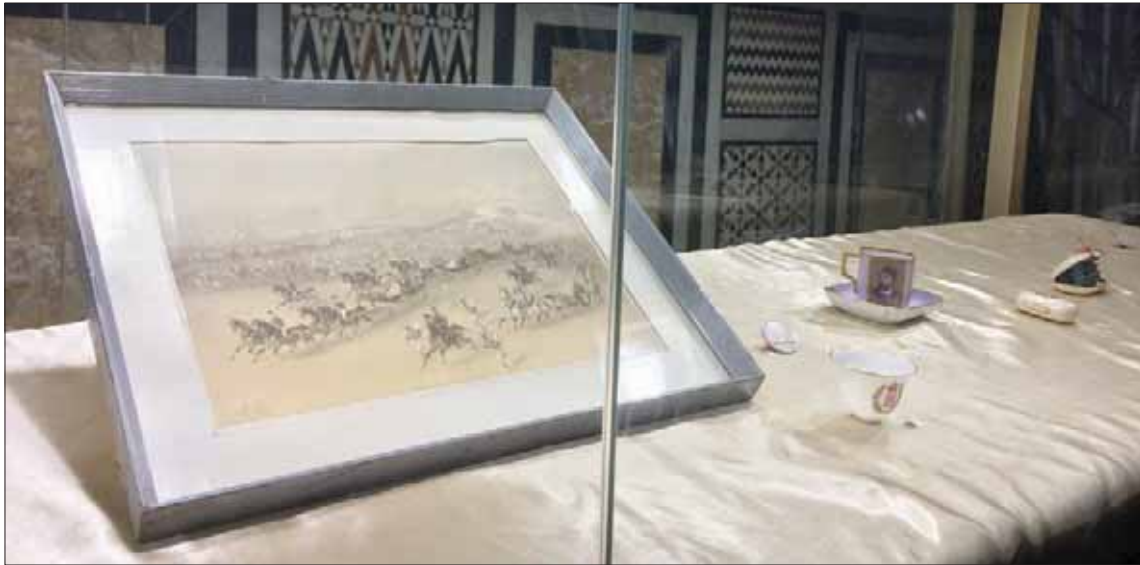
لوحة للفنان الفرنسي إدوارد ريو تمثل افتتاح القناة

يمكن إعادة سرد تاريخ قناة السويس في مصر، التي افتتحت أمام الملاحه العالمية للمرة الأولى عام 1869 - عبر مسارات ثلاثة، أولها الإشارة إلى أهمية القناة كاسرع ممر مائي يربط ما بين قارتي آسيا وأوروبا، وثانيها ذكر ما تعرض له البناء المصريون من تسرف وإجبار على العمل تحت ظروف شديدة القسوة، وثالثها سيرة الخديوي إسماعيل الطموح سليل الأسرة العلوية، الذي افتتح في عهده القناة.