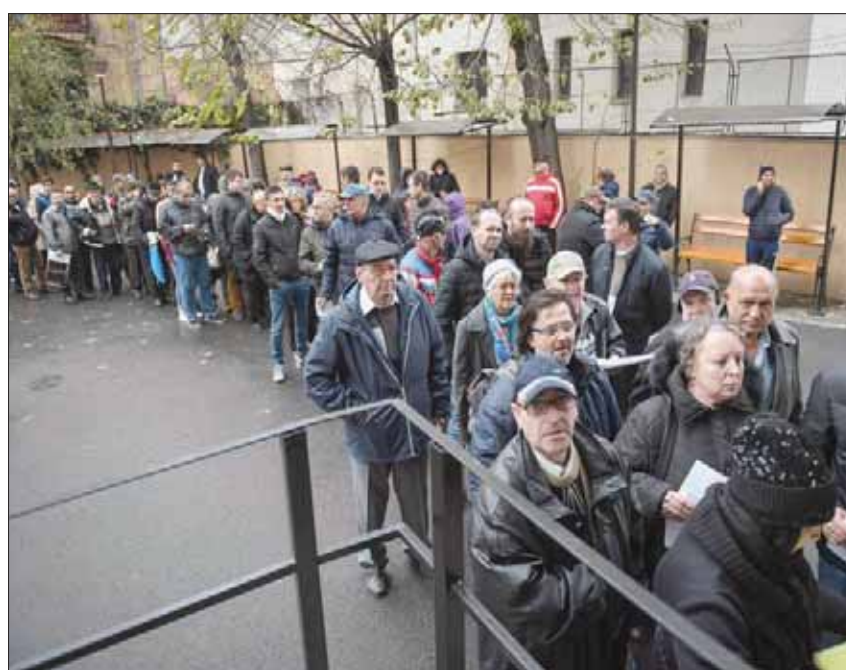
أهالي الضحايا ينتظرون في الطوابير أمس لحضور بدء المحاكمات في المحكمة العليا في العاصمة بوخارست