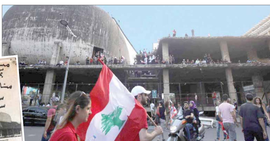
الحياة عادت إلى مبنى «البيضة» وسط بيروت بفعل احتجاجات الشارع