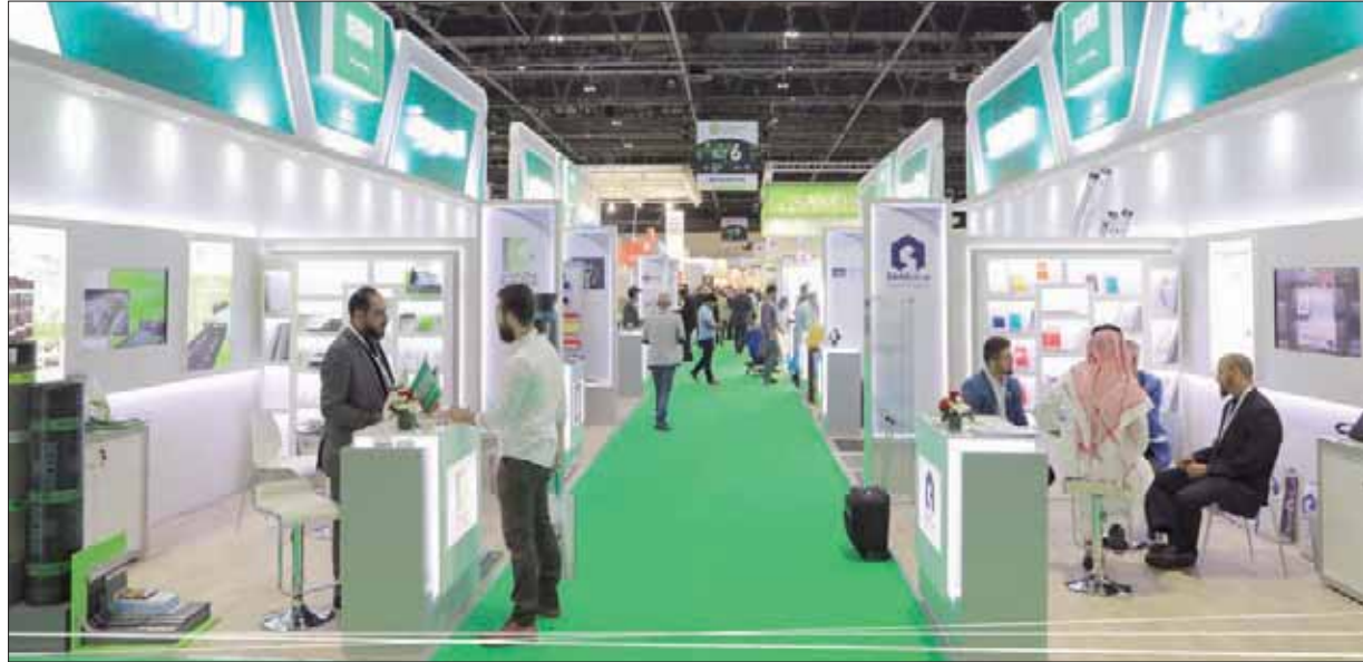
هيئة الصادرات تشجع على دفع المنتجات السعودية للتصدير الخارجي (الشرق الأوسط)

العالمية تغطي جزءاً من التكاليف التي تتحملها الشركات السعودية في المراحل المختلفة من أنشطتها التصديرية. وتتنوع الحوافز التي يغطيها البرنامج لتشمل الإدراج في منصات التجارة الإلكترونية، والمشاركة الفردية في المعارض الدولية، والحصول على شهادات المنتجات، وعمليات التسويق والإعلان، وتسجيل المنتجات دولياً، وتسهيل زيارة المصدّرين المحتملين، والاستشارات واستراتيجية التصدير، وسلاسل التوريد، والدعم القانوني، والتدريب المخصص. ويمكن لجميع المنشآت الراغبة في الاستفادة من الخدمات والحوافز لتسجيل المنشأة في موقع هيئة تنمية الصادرات السعودية الإلكتروني.