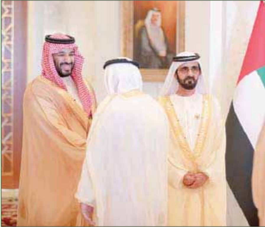
الشيخ محمد بن راشد والأمير محمد بن سلمان في قصر زعييل بدبي أمس

حضر اللقاء الأمير محمد بن عبد الرحمن بن عبد العزيز نائب أمير منطقة الرياض، والأمير بدر بن سلطان بن عبد العزيز نائب أمير منطقة مكة المكرمة، والأمير عبد العزيز بن سعود بن نايف بن عبد العزيز وزير الداخلية، والأمير عبد الله بن بندر بن عبد العزيز وزير الحرس الوطني، والأمير خالد بن سلمان بن عبد العزيز نائب وزير الدفاع، ومحمد التويجري وزير الاقتصاد والتخطيط، والدكتور بندر بن عبد الرشيد سكرتير ولي العهد السعودي، وتريكي الخليل سفير خادم الحرمين الشريفين لدى الإمارات.