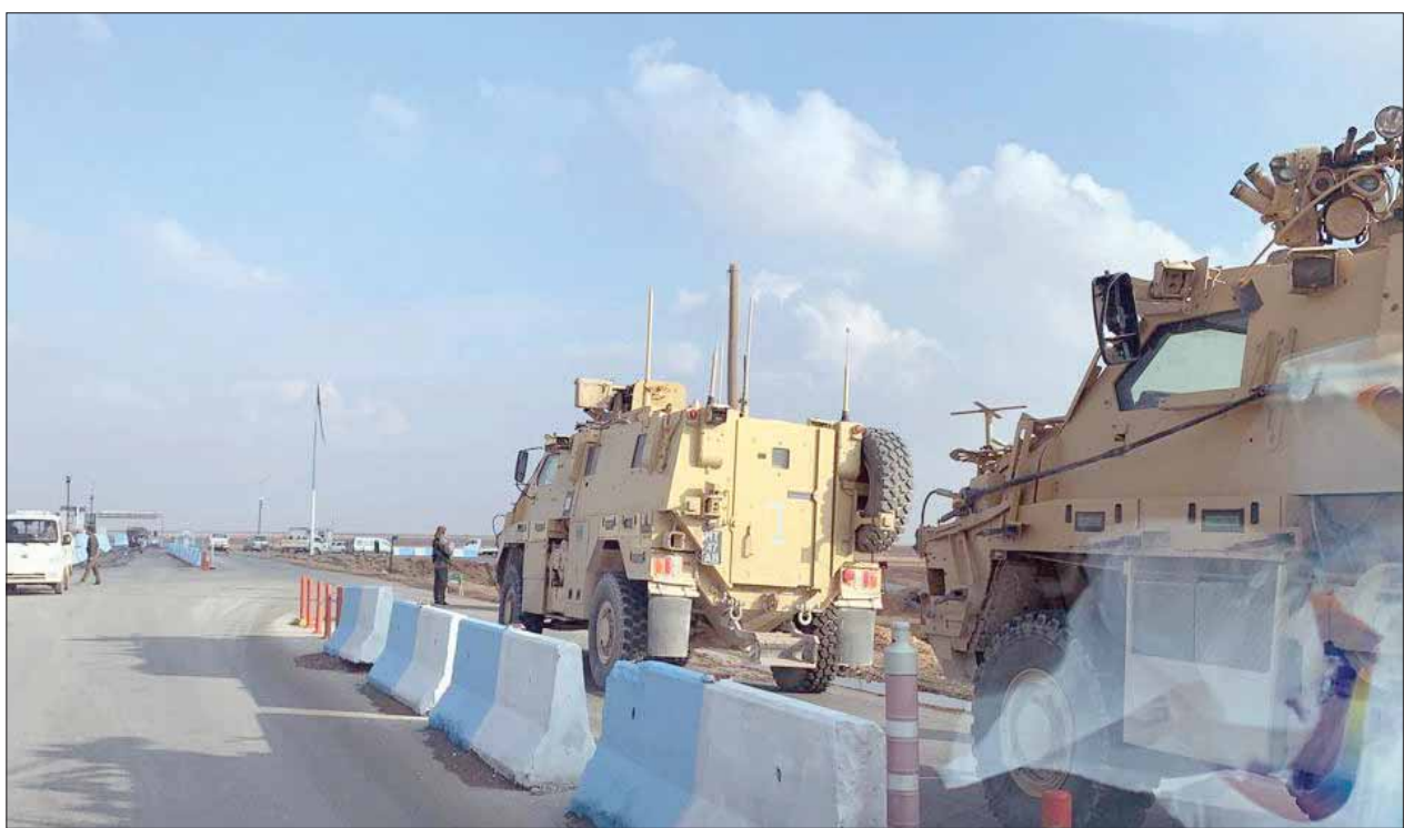
صورة بمتنها «روسيا اليوم» لقوات بريطانية شمال شرقي سوريا أمس

الاستبدادية في إدارة البلاد، (وهؤلاء) يميلون إلى الحفاظ على نمط الاستبداد في الدولة». وأشار إلى أنه «على الرئيس السوري أن يوفر الظروف لاجتبي الدستور الجديد، ويؤكد استعداده لتقبل إرادة السوريين في الانتخابات المقبلة، وإذا استدعى الأمر سيكون ملزماً بالاعتراف بصوابية المرحلة الانتقالية في سوريا، بل وبحكومة عراقية». وحملت تلك العبارة أنها إشارة تصدر من طرف في موسكو بان على الأسد أن يكون مستعدا للتخلي، برغم أن الكاتب أضاف أن هذا لا يعني اعتزال السياسة الخارجية لدمشق، أكد وزير الخارجية التركي مولود جاويش أوغلو ضرورة أن يتحرك حلف شمال الأطلسي (الناتو)