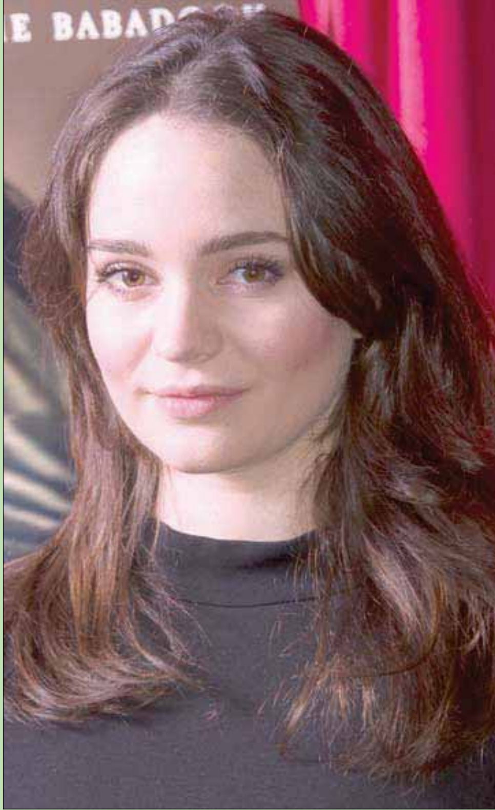
المثلة أريتلغ فرانسيزي حضرت أمس العرض الأول لفيلم «ذا نايتنغيل» في لندن

ليت السلطات المصرية، تفرج ولو على دفعات، عن أسرار هشام عشاوي؛ للاتعاظ والاعتبار، ونزع أقدعة الدجل عن وجوه المتقنعين بها.