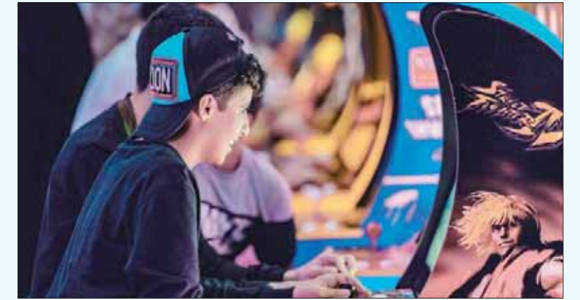
جانب من مهرجان الألعاب الإلكترونية في «موسم الرياض»

الرياض، «الشرق الأوسط» لطالما كانت الألعاب الإلكترونية أحد أهم الخيارات الترفيهية في السعودية، لكنها مع «موسم الرياض» الذي انطلق مؤخراً، باتت تحمل بُعداً آخر، إذ خصص المنظمون مهرجاناً كاملاً للألعاب الإلكترونية، وتوافدت الجموع لافتتاحه في «واجهة الرياض» أمس. ويعد المهرجان الذي يستمر أربعة أيام، الأبرز في مجال الألعاب الإلكترونية في المملكة المتحدة، ويتضمن آلاف الألعاب التي تجمع بين الترفيه والتعليم والمتعة والتحدى، ومن أشهرها: فورتنيت، وبيجي، وأوفر ووتش، وفي 2018، إضافة إلى مسابقات ونهايات للألعاب الإلكترونية، ومسابقات كوسبلاي التي يصل إجمالي جوائزها إلى 10 آلاف دولار، مع حضور ضيوف دوليين، وعروض متخصصة على المسرح. وقال مارتين غييز الرئيس التنفيذي لمجموعة غيم: «تعد السعودية أسرع أسواق العالم نمواً في مجال الألعاب الإلكترونية، وتتميز أسواق الشرق الأوسط بطلب كبير على هذا المحتوى». وأضاف أن المسابقات في السعودية حدث فريد لأنها مخصصة للاعبين ومن تصميم لاعبين. وتابع بأنه «من الجميل أن نتمكن من إيجاد