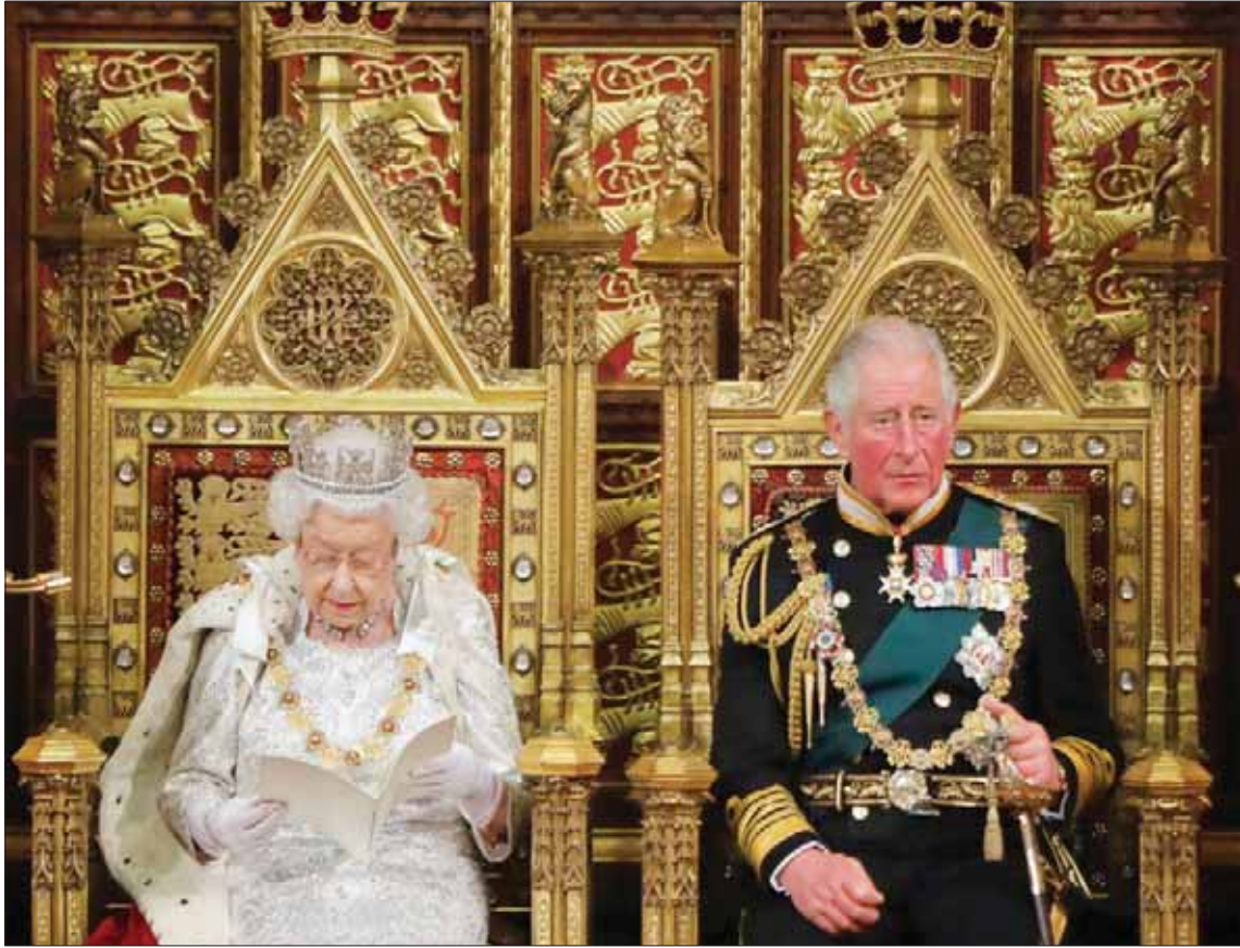
الملكة تترك سننها المتقدمة وتريد انتقالاً سلسلاً للحكم