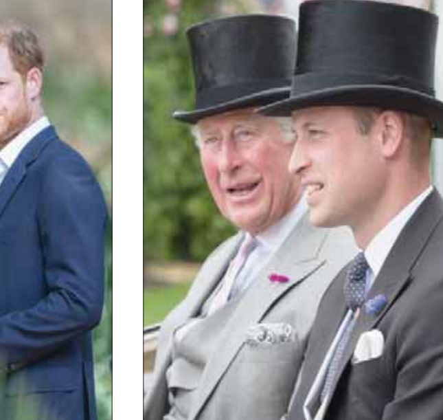
توقعات بتقليص نفوذ العائلة المالكة

في إقصاء الأمير أندرو ليصبح الأمر أوضح. وحسب عدد من التقارير الإخبارية الصادرة أمس، فيبدو أن الملكة ستنتهز فرصة عيد ميلادها الـ95 للاسحاب الكامل من الحياة العامة مثلما فعل