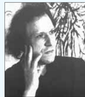
الرسم نبيل قانصو

استعدادات المقاتلين، وكيف يستغلون الطائفة للتعبير عن العنف الذي مارسوه. ولما عاد إلى الولايات المتحدة، قرر الانتقال إلى نيويورك إلى أتلانتا، حيث طاب السكن له ولأفراد عائلته. ولما اشتدت وطأة الحرب اللبنانية، رسم نبيل عدة لوحات تحت عنوان «الفن في خدمة السلام»، وكانت أهمها جدارية تمثل عنواناً غريباً هو «العقاب الألهي».