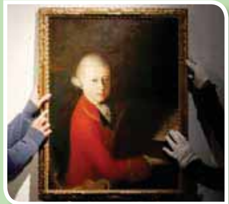
لوحة موتسارت لدى عرضها بدار كريستيز

ورسمت هذه اللوحة بطلب من بييترو لوجاتي، المسؤول العام عن الضرائب في مدينة البندقية، الذي شاهد موتسارت وهو يعزف في حفل بمدينة فيرونا في يناير (كانون الثاني) عام 1770. ولد موتسارت عام 1756 في سالزبورغ في النمسا، وتوفي عام 1791.