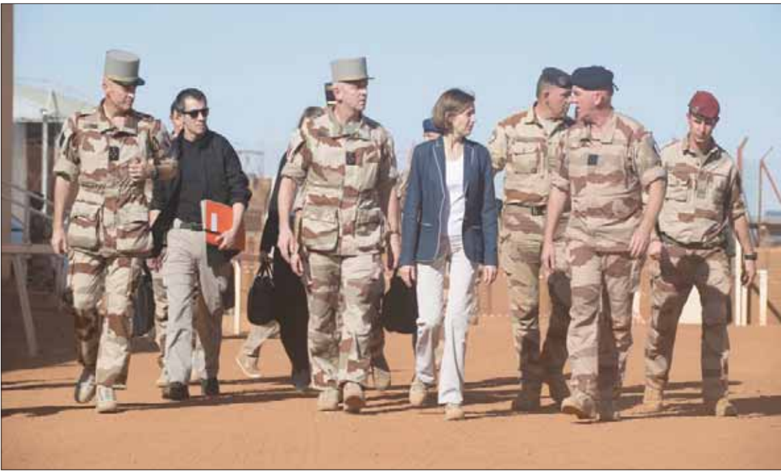
وزيرة الجيوش الفرنسية فلورنس بارلي لدى وصولها إلى قاعدة غاو بمالي أمس للمشاركة في تشييع نعوش الجنود الـ13

في دول الساحل الخمس (مالي، النيجر، بوركينا فاسو، تشاد، وموريتانيا). وقال الناطق باسم هيئة الأركان الكولونيل ليرايون باربري، في تصريح صحفي، إن «كل الجناسين تم انتشالها وهي بامان وبايد فرنسية»، نافية بشكل ضمنى أن يكون الإرهابيون قد نجحوا في اختطاف أي جندي فرنسي أو جنائمه، خلال العملية العسكرية التي جرت في مناطق وعرة على الحدود مع بوركينا فاسو.