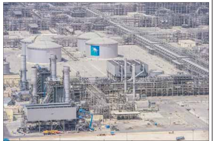
اكتتاب أرامكو يسجل حضور الأفراد بشكل قياسي في الساعات الأخيرة

4,1 مليون مكتب يشترون 1,1 مليار سهم بقيمة 10,1 مليار دولار