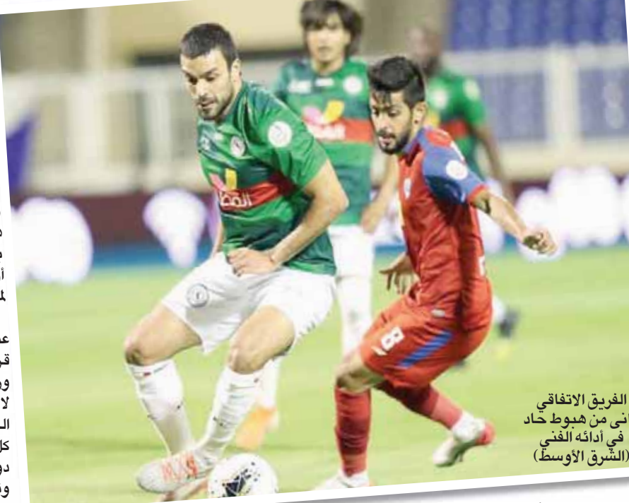
الفريق الاتفاقي على من هبوط حاد في أدائه الفني