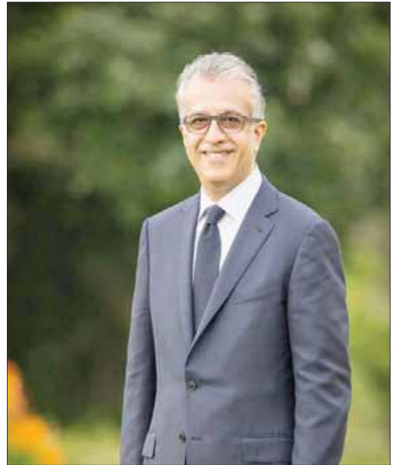
الشيخ سلمان آل خليفة (الشرق الأوسط)

كوالالمبور، الشرق الأوسط سجل الاتحاد الآسيوي لكرة القدم أرقاماً قياسية تاريخية ببطولة دوري أبطال آسيا لعام 2019 من خلال إحصاءات منصات وسائل التواصل الاجتماعي، التي تابعت البطولة منذ انطلاقها في شهر مارس (آذار) الماضي حتى المباراة النهائية في 24 نوفمبر (تشرين الثاني) الحالي، والتي جمعت الهلال السعودي وأوراوا دايوندا الياباني وشهدت تويج الفريق السعودي بلقب للمرة الثالثة بتاريخه على استاد سايتاما بالعاصمة اليابانية طوكيو. وأظهرت الإحصاءات ارتفاعاً تاريخياً للتفاعل مع أحداث المسابقة الأكبر قاطعاً على صعيد الأندية حيث شارك 305 ملايين و800 ألف قارئ على شبكة التواصل الاجتماعي (تويت)، و260 مليوناً و900 ألف شخص على (إنستغرام). وتمت مشاركة وتفاعل أكثر من 78 مليوناً و900 ألف شخص على (فيسبوك)، كما شهدت القناة التابعة للاتحاد الآسيوي على شبكة (يوتيوب) زيادة مذهلة بنسبة 556 في المائة في عدد المشتركين الجدد، فيما أظهرت الإحصاءات تسجيل ارتفاع غير مسبوق في متابعة حسابات الموقع الإلكتروني الرسمي. وأكد الشيخ سلمان بن إبراهيم رئيس الاتحاد الآسيوي للعبة: «بطولة دوري أبطال آسيا تمثل قمة صوحاتنا، وتتيح للفريق واللاعبين الآسيويين فرصة للنجاح على الساحة العالمية، والنتائج التي تفخر بها فرقنا في كأس العالم للأندية تجسد الجودة والمكانة المتنامية لبطولتنا إلى جانب السد القطري، أتمنى أن يحقق الهلال أيضاً الأفضل في كأس العالم».