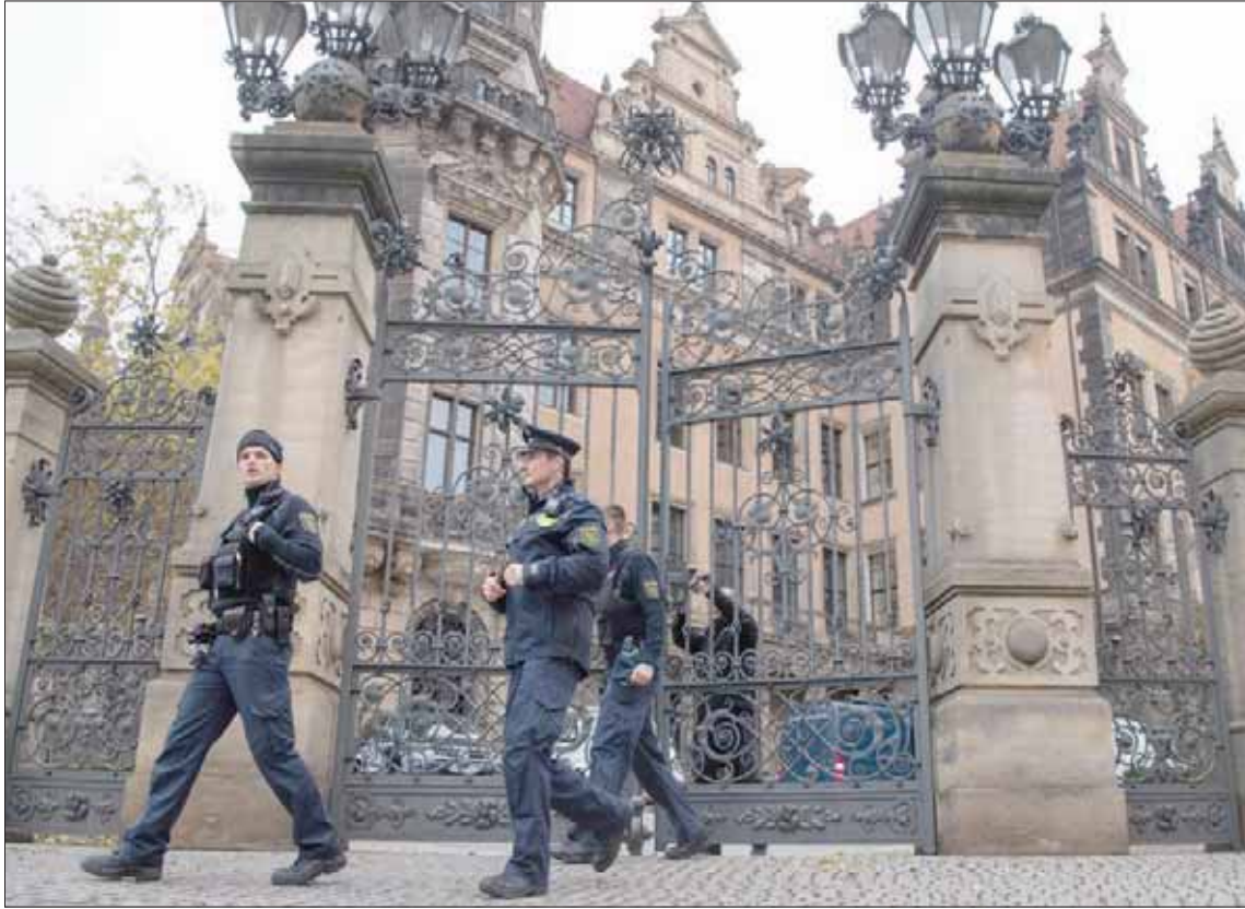
الشرطة يحيط بقصر ريزندزنشولس حيث يوجد متحف «القبو الأخضر» بدريسدن

للاجئين القادمين جديداً إلى ألمانيا، لتجنيدهم للقيام بأعمال غير شرعية لصالحها، مثل بيع المخدرات أو تنفيذ سرقات صغيرة، مستفيدين من واقع أن لا سجل إجرائياً لهؤلاء الجدد. وغالباً ما يمكن مشاهدة أفراد تلك العائلات يقودون سيارات فارهة في برلين، بسرعة جنونية. وباتت صور مدهامة الشرطة لسيارة «مرسيدس» ذهبية اللون، رمزاً للمبريق الذي يحيط هؤلاء أنفسهم به.