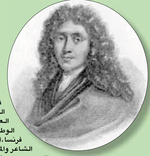
الشاعر والكاتب والمسرحي الفرنسي موليير

القاهرة، حازم بدر فرنسيان من المركز الوطني للبحوث العلمية والمدرسة الوطنية للوثائق في فرنسا، النظرية القائلة بأن الشاعر والمسرحي الفرنسي الكبير بيير كورنيل (1606 - 1684)، هو من كتب الكثير من أعمال الشاعر والكاتب والممثل جون بايتيست بولكان