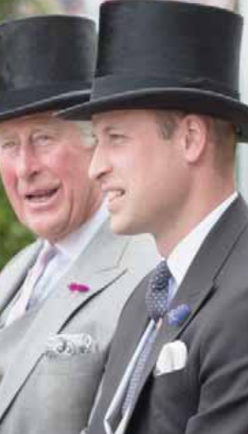
مشكلة الأمير أندرو خلقت وضعاً جديداً في العائلة

حضور مراسم وضع إكليل الزهور على التابوت التذكاري لضحايا الحرب للمرة الثانية، وكان ذلك أول ما قام به في العام الماضي بعد أشهر قليلة من تقاعد والده الأمير فيليب من منصبه، ومؤخراً جاء دور تشارلز المحوري