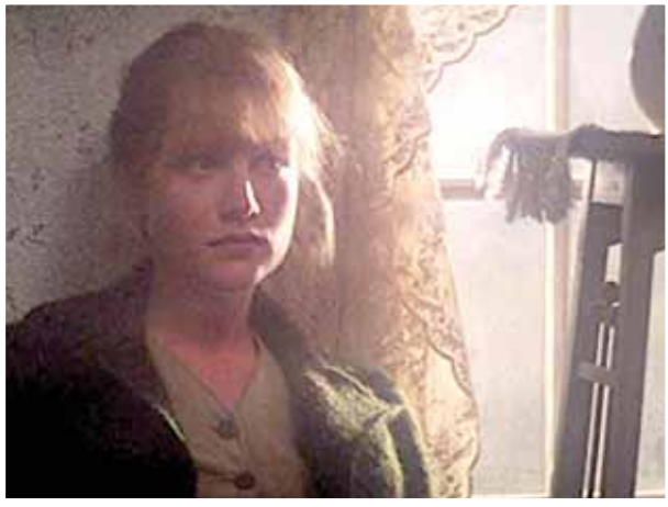
إيزابيل أوبير في «بوابة الجنة»

كيف إذن يمكن لهذا الفيلم أن يتجاوز كل هذه المأزق وينجلى عن عمل رائع وبيدع وذو سياق لا يكشف عن أي مصاعب من تلك التي خاضها؟ كان مايكل شيمينو خرج من انتصار باهر قبل ثلاث سنوات عندما حقق «صائد الغزلان» سنة 1978. ذلك الفيلم الذي خاض حرب فيلتمام بموضوع ذي عناصر ملحمة وأسس لميرلين ستريب وقدم روبرت دينيرو في وجهة