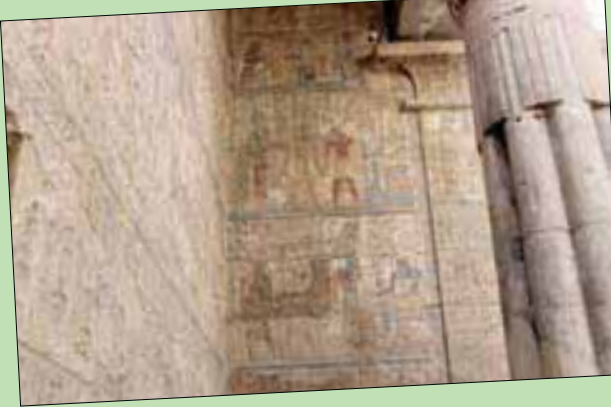
نقوش ورسومات معبد الأقصر