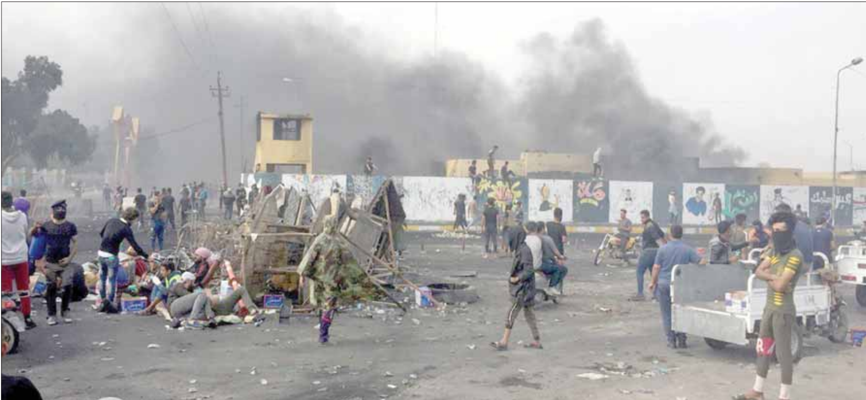
محتجون امام قاعدة عسكرية في الناصرية أمس

بيان للخارجية أمس الخميس عن «أسفه لما حدث، عاداً أنّ هذا العمل الإجرامي لن يمرّ من دون تحاشية الأشخاص الذين قاموا به، وأنّ السلطات الأمنية تجري تحقيقاتها؛ لغرض التوصل إلى الفاعلين».