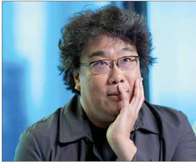
المخرج بونغ جون-هو

المشهد ذاته، مصوّر بكاميرا تصاحب الشاب من الخلف، يعبر عن بداية زلزال صغير في الذات لمن يبحث لنفسه عن هوية جديدة. الشاب الآتي من القاع سيكذب لكي ينتمي، على نحو أو آخر ومن دون الكشف عن مستوى طبقته، إلى هوية جديدة. السلم الحجري ذاته هو ما تستخدمه العائلة في هروبها من المنزل في النهاية والكاميرا (تصوير كيونج - ببو هونغ) في هذه الحالة تتراجع بعدما كانت تتقدم ثم تصب كامل قدراتها على تجسيد الفيضان الذي دخل بيت العائلة الذي تعرفنا عليه في مطلع الفيلم وقد تحول إلى مستنقع أسن.