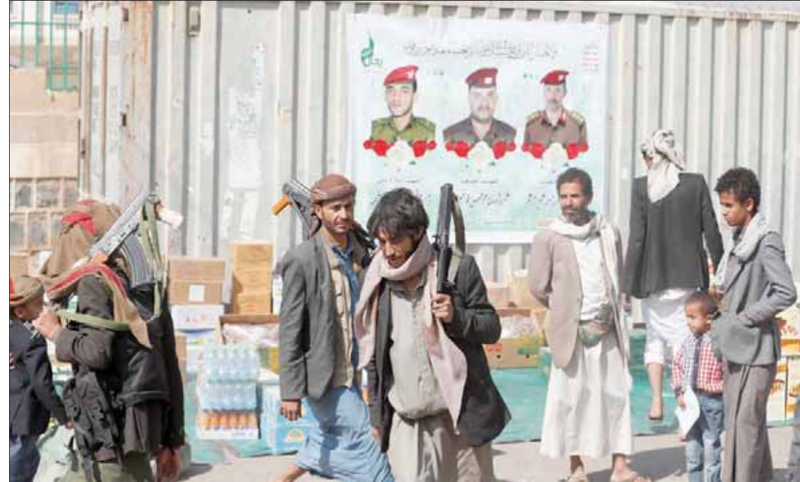
مسلحون تابعون للحوثيين في صنعاء