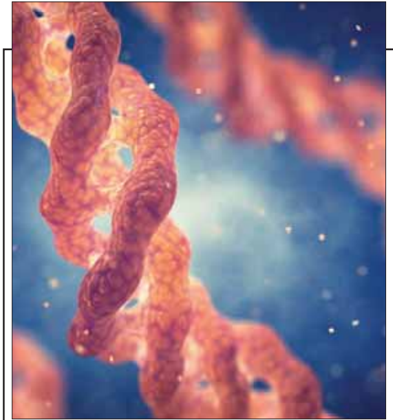
شكل لجزئية الكولاجين

وكانت الدراسة التي قام بها باحثون من جامعة تورونتو بكندا ونشرت في النسخة الإلكترونية من مجلة الطب النفسي الاجتماعي