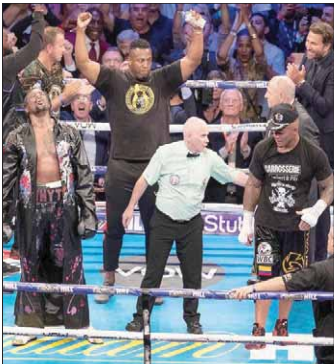
الجمامير السعودية على موعد مع منازلات مثيرة في الملاكمة