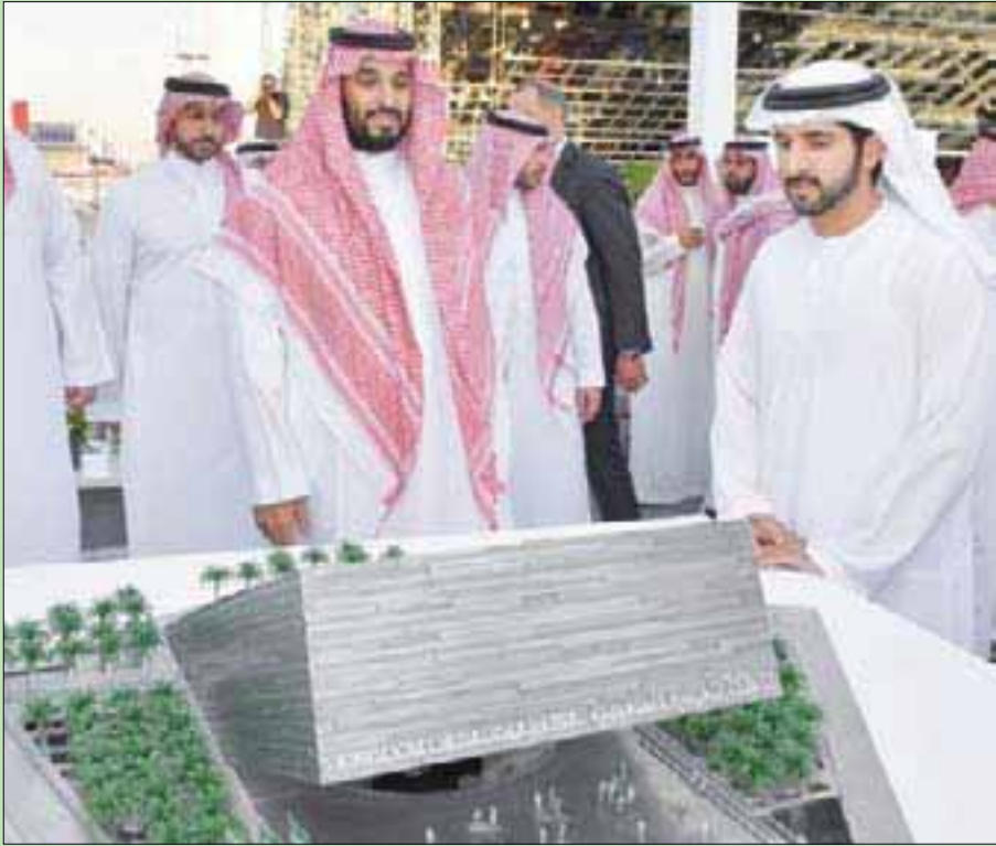
ولي العهد السعودي والشيخ حمدان بن محمد خلال زيارتهما لموقع إكسبو 2020 دبي أمس

مقر معرض إكسبو 2020 دبي الذي تستضيفه الإمارات خلال الفترة من 20 أكتوبر (تشرين الأول) 2020 إلى