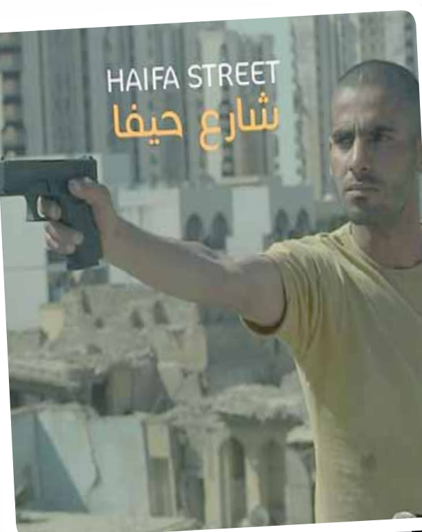
لقطة من فيلم «شارع حيفا»