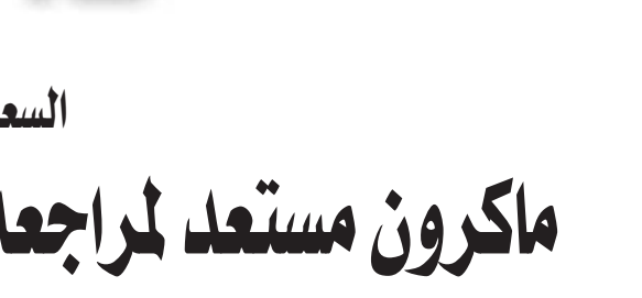
نواكشوط، الشيخ محمد

أعلن الرئيس الفرنسي إيمانويل ماكرون، أمس (الخميس) أنه مستعد لمراجعة «كافة الخيارات الاستراتيجية» لفرنسا في إطار الحرب التي يخوض جنودها ضد الإرهاب في منطقة الساحل الأفريقي، وذلك بعد مقتل 13 جندياً فرنسياً حاداً تصادم مروحيتين عسكريتين أثناء ملاحقة إرهابيين في دولة مالي. وقال ماكرون في تصريح صحفي عقب لقاء جمعه مع الأمين العام لحلف شمال الأطلسي ينس ستولتنبرغ، إنه طلب من الحلفاء «مشاركة أكبر للتصدي لالإرهاب»، قبل أن يضيف: «فرنسا تقوم بعمليات باسم الجميع (في منطقة الساحل الأفريقي)، مهتمنا هناك في غاية الأهمية. لكن الوضع الذي نشهده في منطقة الساحل يدفعنا اليوم إلى النظر في كافة الخيارات الاستراتيجية».