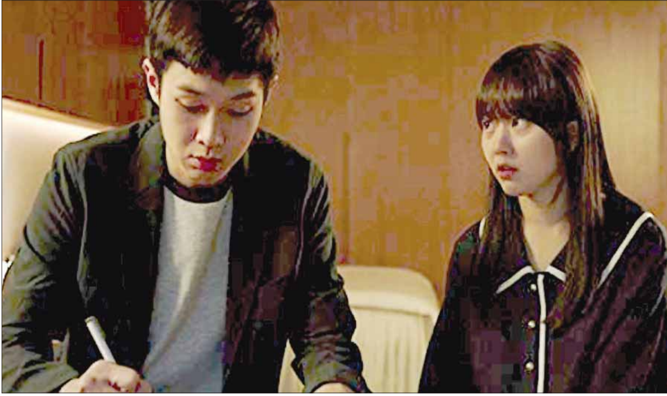
من «طفيلي»: المدرس الزيف

يختلف «طفيلي» (Parasite) وهو الفيلم الأكثر حظاً بالفوز بأوسكار أفضل فيلم أجنبي حتى الساعة، للمخرج الكوري الجنوبي بونغ جون-هو، عن أفلام كثيرة عاينت الفقراء في المدن الكبيرة المحاذين جغرافياً، لأثريائها، وعن العديد من الأفلام التي تتحدث عن صعود وهبوط الطبقات الفقيرة في حقيقة أن هذا الصعود إلى القمة، ولبعض الوقت، لم يكن نتيجة عمل شاق وجهد ثابت. كذلك لم يكن نتيجة ورقة حظ أو لقاء صدفة يجدها الفقير فرصة سانحة وغير متوقعة لكي يرتفع فوق سطح الدنيا، بل نتيجة ساقطها المعرفة بالتكنولوجيا واستخدامها وسيلة خداع. عندما وجدت الفتاة التي تعيش في بيت تحت مستوى الأرض مع والديها وشقيقها فرصة لكي ترزق شهادة تخول لشقيقها تلبية إعلان نشرته عائلة بارك الثرية بحثاً عن معلم لابنتها المراهقة، لم تتأخر.