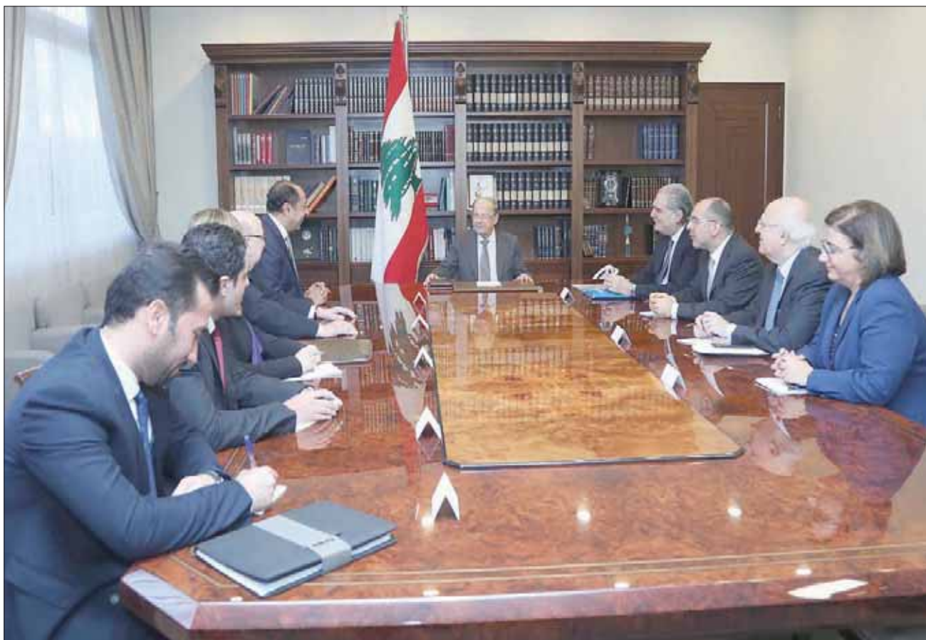
الرئيس ميشال عون مجتمعاً أمس مع الأمين العام المساعد للجامعة العربية والوفد المرافق (دالتي ونهرا)

دخلت المشاورات السياسية لتسمية رئيس جديد للحكومة مرة أخرى مرحلة التأزم، مع إصرار «حزب الله» و«التيار الوطني الحر» على تسمية رئيس حكومة تصريف الأعمال سعد الحريري، لرئاسة الحكومة العتيدة، ورفض الأخير تأليفها وفق شروطهما، وسط تنامي الأزمات الاقتصادية والمالية ودخولها مرحلة المخاوف من أن تأخيرها على المصارف التي تشهد أحدها، أمس، تجمهراً أمام أبوابه في مدينة صور في جنوب لبنان، ما يشير إلى حالة هلع لدى المواطنين على ودائعهم.