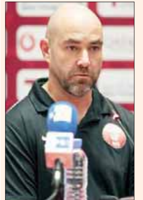
الدوحة، الشرق الأوسط»

دافع الإسباني فيليكس سانشيز المدير الفني للمنتخب القطري لكرة القدم عن فريقه، وأكد أن الفريق قدم أداء جيداً في المباراة الافتتاحية لبطولة كأس الخليج (خليجي 24) وأنه فشل في ترجمة الفرض التي حصل عليها إلى أهداف لتنتهي المباراة بنتيجة غير مرضية له.