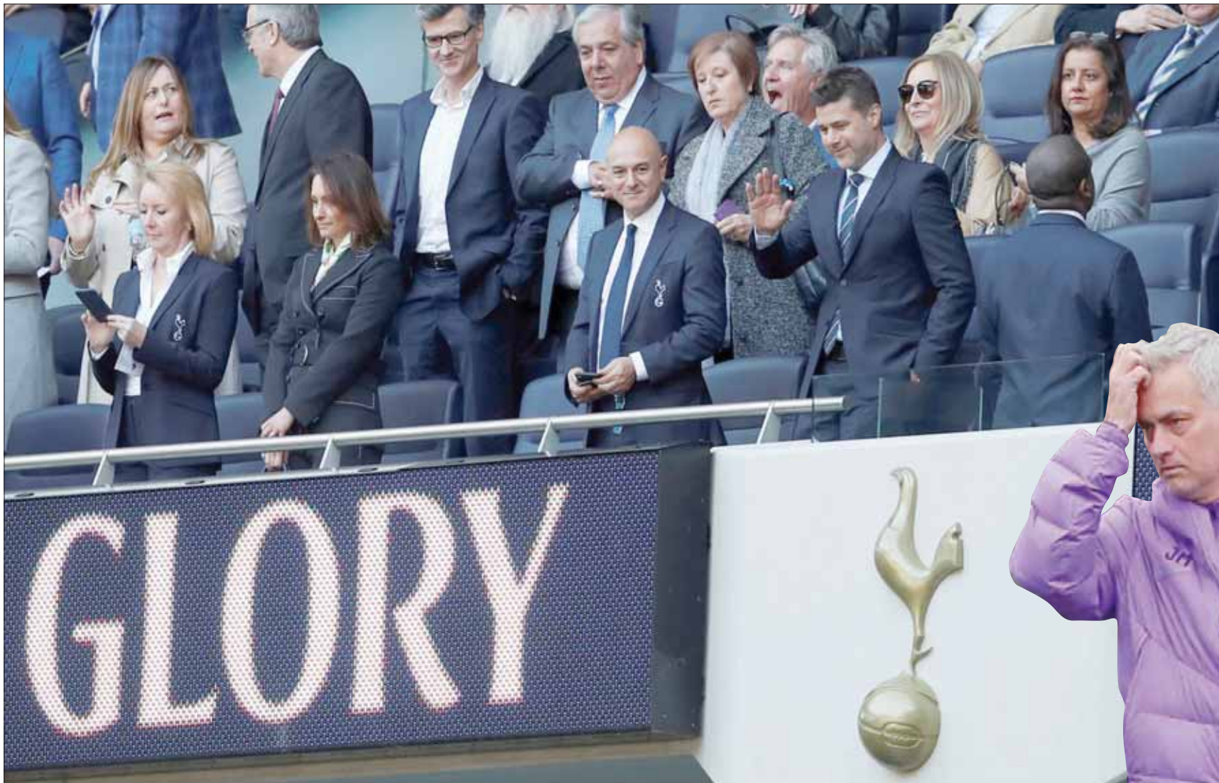
لم يسمح ليفي رئيس توتنهام ليوكيتينو بأن ينفق الكثير من الأموال على التعاقد مع لاعبين جدد

في التاسع والعشرين من سبتمبر عام 2018، بدأ مانشستر يونايتد تحت قيادة المدير الفني البرتغالي جوزيه مورينيو مكسوراً، حيث كانت الشاشة العملاقة بملعب وستهم في تلك الليلة تعلن تأخر «الشياطين الحمر» بثلاثة أهداف مقابل هدف وحيد، وهي الخسارة التي كانت بمثابة آخر مسمار في نعش المدير الفني البرتغالي. ولم يغادر أحد شروق لندن في ذلك اليوم وهو يعتقد أن مورينيو سيبقي في منصبه فترة أطول من ذلك. وكان مورينيو يواجه صعوبات كبيرة مع مانشستر يونايتد لمدة شهرين ونصف - شجار وجدل واختيار لفة صبره وتحمله - وعندما جاءت النهاية وأقبل مورينيو من