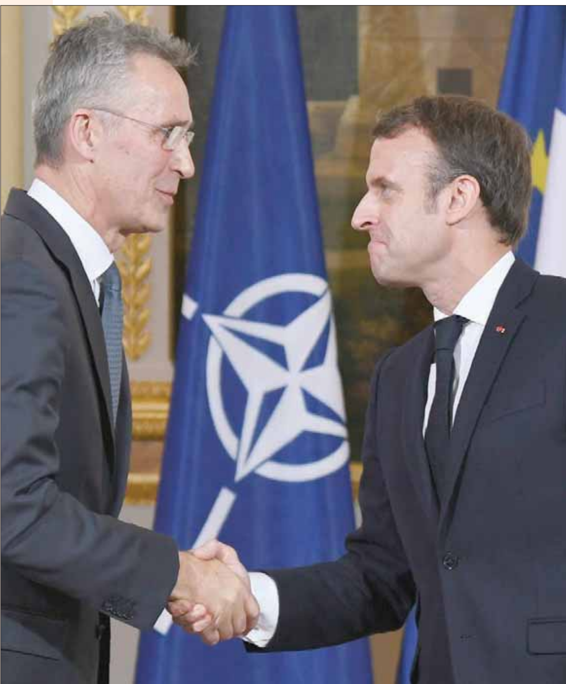
ماكرون مع ستولتنبرغ في باريس أمس لتسوية الخلافات بين فرنسا وحلف إثر تصريحات الرئيس الفرنسي

وقال الناطق باسم الكرملين ديمتري بيسكوف، إن رد الرئيس الفرنسي «لم يحمل طابعاً تفصيلياً، لكنه يؤكد تفهم باريس لقلق موسكو، واستعدادها للحوار حول هذا الشأن». وأضاف أن رئيسي المتحريين في شرق البلاد ببيان رفضت فيه بشكل تام مذكرتي التفاهم في المجالين الأمني والبحري الموقعتين مع تركيا. ووصفت الحكومة المؤقتة، في بيان «إبرام اتفاق دفاع مشترك مع الجانب التركي» بأنه يهدف إلى تقويض جهود القوات المسلحة العربية الليبية في اجتهات الإرهاب من العاصمة طرابلس، وطرد الميليشيات المسلحة منها». وشدد البيان على أن الرئيس التركي رجب طيب أردوغان يسعى