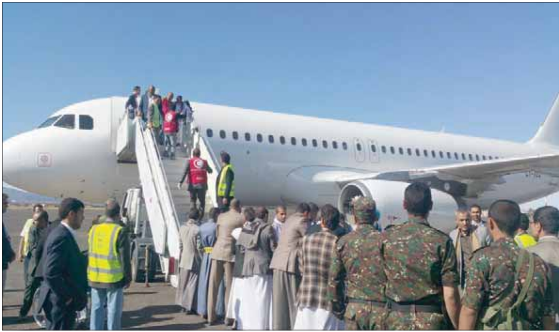
موظفو الصليب الأحمر يساعدون الأسرى المفرج عنهم لدى وصولهم إلى صنعاء أمس

وأضاف: «أكرر دعوتي لجميع الأطراف للعمل مع مكتبي ومع اللجنة الدولية للصليب الأحمر على مبادرات مستقلة لتبادل المحتجزين لتخفيف المعاناة الشديدة لعائلات المحتجزين الذين ينتظرون عودة ذويهم».