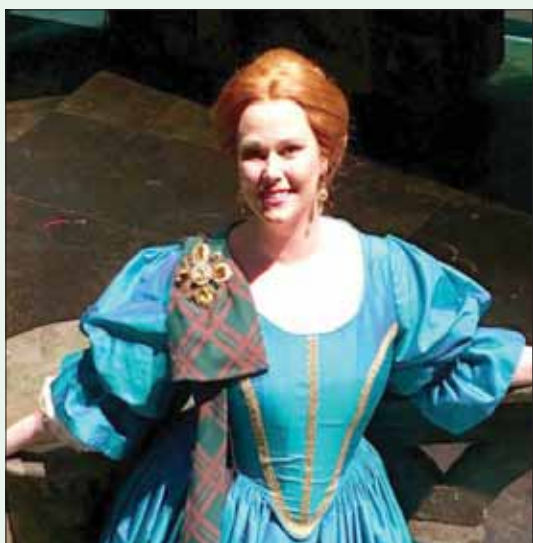
السوبرانو جيسكا برات تشارك في «بيروت ترم»

عازف الكلاويينيت الإيطالي العالمي فابريزيو ميلوني حفلة موسيقية يرافقه فيها لوكا ماغيارييلو على آلة التشيللو، وفوستو دي بينديتو على البيانو. وتقام هذه الحفلة في قاعة «أسمبلي هول» في الجامعة الأميركية، بالتعاون مع المركز الثقافي الإيطالي في لبنان. «هناك حفلات عملنا على تحضيرها منذ فترة طويلة (كلاسيكيات أرمنية)، التي ومن المقرر أن يكون الموعد النهائي لتلقي الطلبات هو 20 ديسمبر (كانون الأول) من عام 2019 الجاري.