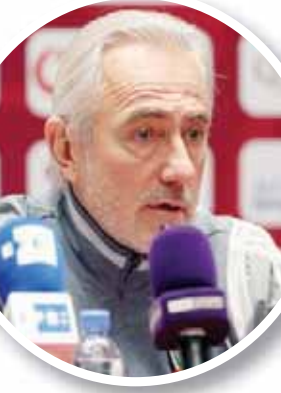
فان ماركيفك مدرب المنتخب الإماراتي (الشرق الأوسط)

وأضاف كاتانيتش الذي قاد العراق لتصرد مجموعة في تصفيات كأس العالم 2022، من دون هزيمة في خمس مباريات، بما في ذلك الفوز على إيران قبل أسبوعين في الأردن: «علينا أن نُؤدي بشكل أفضل، وأن يكون مستواً أكثر ثباتاً، وأن نحافظ بالكرة لفترات أطول. أقدامنا لا تزال على الأرض. لدينا ثلاث نقاط، وصنع كثيراً من صعبة أخرى، ويعرف اللاعبون ذلك، وسنحاول أن نبدل قصاري جهداً، لا شيء أكثر من ذلك».