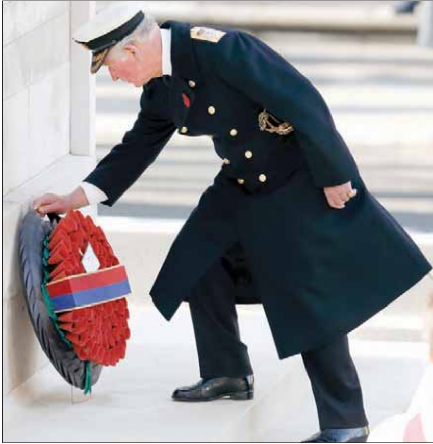
الملكة أنابث الأمير تشارلز لوضع اكليل الزهور على النصب التذكاري لضحايا الحرب العالمية