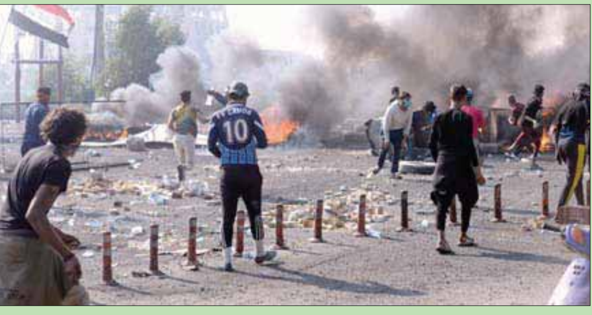
مواجهات بين المتظاهرين وقوات الأمن في مدينة الناصرية بجنوب العراق أمس