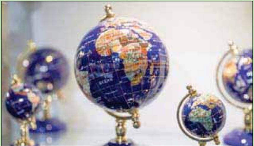
مجسمات كرة أرضية مصنوعة من أحجار اللازورد الثمينة تعرض في مجمع «مينرال وورد» في كيب تاون بجنوب أفريقيا الذي افتتح في عام 1970 ويضم مجموعة كبيرة من الأحجار الكريمة وشبه الكريمة والمعادن، ويضم المجمع مصنع الأحجار الكريمة ومتجر الكريستال، وحديقة الأحجار الكريمة المرقطة للأطفال ولعلها للغولف تحت الأرض