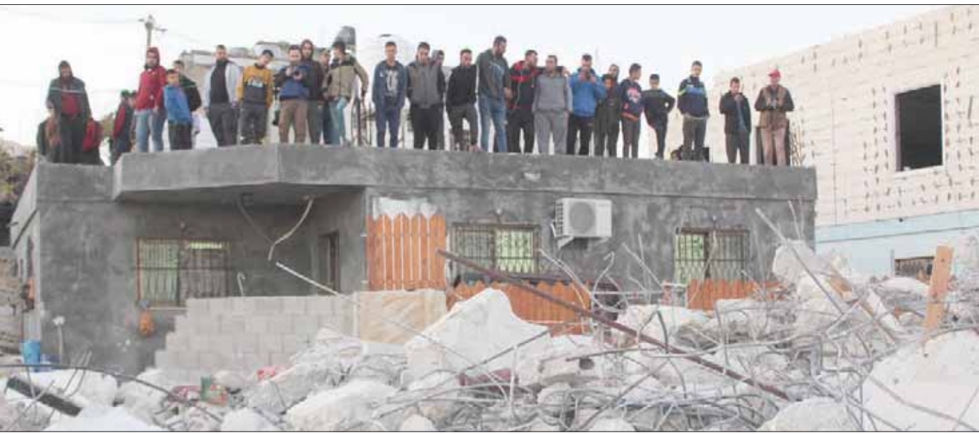
تفحص الدمار الذي حل بيوت أهالي موقوفين لطعنهم جندياً إسرائيلياً في بلدة دير كاحل في الضفة