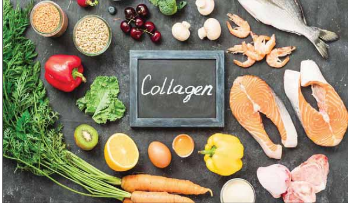
أغذية غنية بالكولاجين

على الكولاجين يمكن استخدامها بشكل تجميلي لإزالة الخطوط والتجاعيد من الوجه، كما يمكن أن يُحسن حَقن الحشوات تلك مظهر الندبات الجلدية، وفي ملء المناطق التي زالت نضارة الأمتلاء عنها.