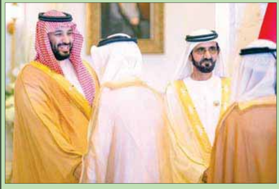
الأمير محمد بن سلمان والشيخ محمد بن راشد خلال حفل الاستقبال في دبي أمس

معرض «إكسبو 2020 دبي» الذي تستضيفه الإمارات خلال الفترة من 20 أكتوبر (تشرين الأول) 2020 إلى 10 أبريل (نيسان) 2021. بمشاركة 192 دولة تحت شعار «نواصل العقول وضمن مربع» تم انتقالا إلى المنطقة المحيطة للجناح السعودي الذي كانت الملكة قد كشفت النقاب في أبريل الماضي عن تصميمه بمساحة 13,069 ألف متر مربع. وشاهد الأمير محمد بن سلمان والشيخ حمدان بن محمد بن راشد فيلما قصيرا حول تصميم الجناح السعودي الذي سيشمل الأضواء على رسالة الملكة للعالم وانفتاحها في التواصل على جميع الأصعدة الاقتصادية والسياحية والثقافية لصناعة مستقبل أفضل للجميع. (تفاصيل ص 2)