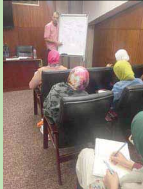
جانب من أحدث دورة لتعلم اللغة الهيروغليفية في مكتبة الإسكندرية