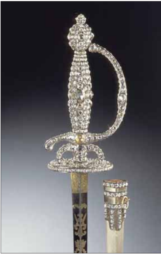
سيف مرصع بالماس من المسروقات من «القبو الأخضر»