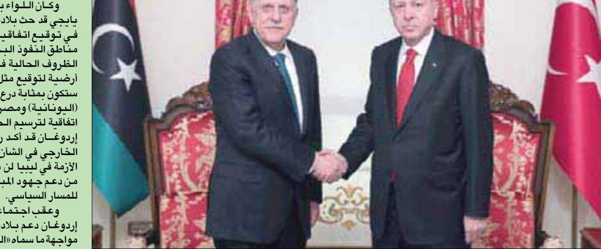
الرئيس التركي خلال استقباله فائز السراج في القصر الرئاسي بإسطنبول ليلة أول من أمس

الولاية البحرية في البحر المتوسط، باستثناء قبرص».