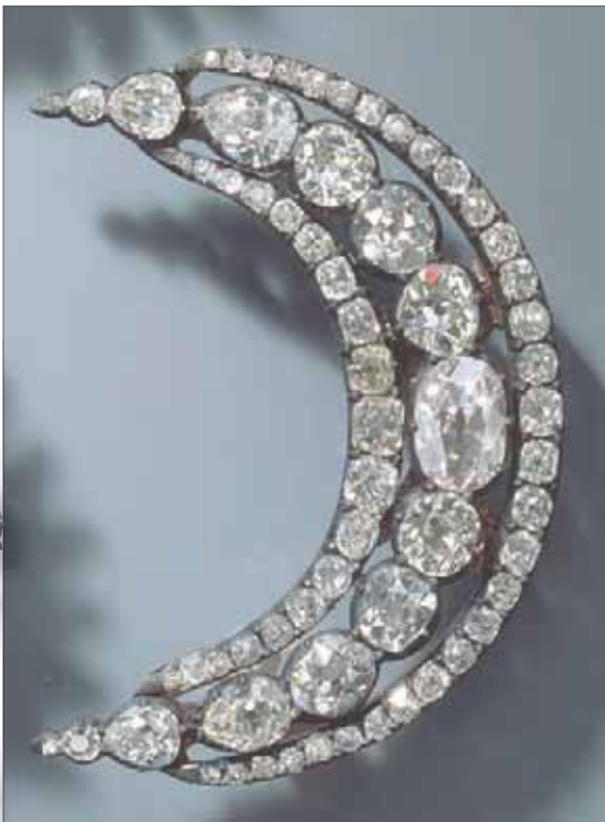
من المسروقات من «القبو الأخضر» بدريسدن

الشرطة وحتى الإعلام قصص هذه العائلات، خوفاً من اتهامها بالعنصرية، وهو أصلاً ما يستخدمه أفراد تلك العائلات ضد الشرطة بشكل مستمر، لدى اللقاء القبض على أحدهم؛ يبدؤون بالصراخ عالياً متهمين الشرطة بانهم «نازيون». ولكن مؤخراً ومع تزايد جرائمهم، وتوسعها، قررت الشرطة في برلين ومدن أخرى ينشطون فيها، بتشديد مضايقاتهم لهم من خلال الانتشار بشكل شبه دائم في مناطقهم، مثل شارع زوننالي المعروف بشارع العرب في نويكولن، وكل بضعة أسابيع، تتخطف الشرطة مدهامات على مطاعم لاراكيل أو محال لبيع الأفراد العصابات العربية لتبييض الأموال. وتتخطف الشرطة اليوم من استغلال هذه العصابات