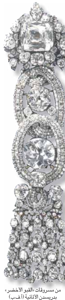
من مسروقات «القبو الأخضر» بدريسدن الألمانية

ولكن رغم اللقاء القبض عليهم وزجهم في السجن بشكل مستمر، فإن أفراد هذه العائلات غالباً ما يخرجون بعد قضاء فترة وجيزة خلف القضبان، ليعاودوا ممارسة نشاطاتهم بعد الخروج. وما زالت الشرطة عاجزة فعلياً عن جمع أدلة تورطهم بتبييض وتهريب الأموال والاتجار بالمخدرات وجمع الخوات وغيرها من النشاطات الكثيرة غير الشرعية.