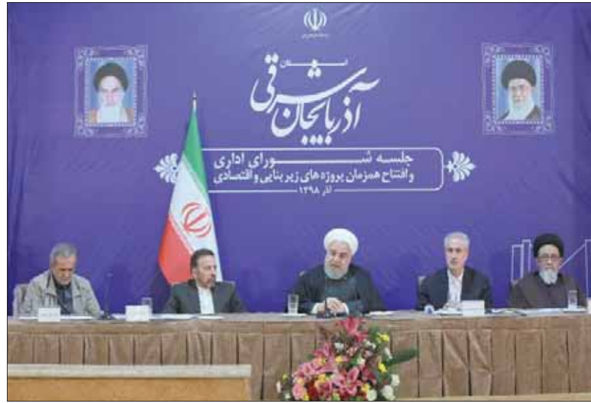
الرئيس الإيراني يلقي خطاباً في مدينة تبريز شمال غربي البلاد أول من أمس

إيران تواصل حملة الاعتقالات بعد أسبوعين على الاحتجاجات