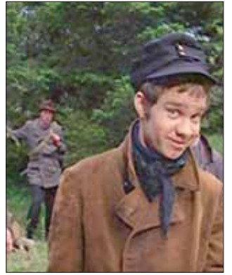
مايكل ج. بولارد في «هانيبال بروكس»

الجوائز التي أعلنت قبيل ختام المهرجان في دورته الحادية والثلاثين. الناقدة اللبنانية السابقة ربما مسمار (التي تعمل الآن في مؤسستها الخاصة) شاركت لجنة تحكيم تألفت من خمسة سينمائيين بينهم الإيراني اللاجئ إلى فرنسا محسن مخملباف.