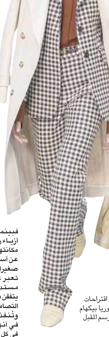
من اقتراحات فيكتوريا بيكهام للموسم المقبل