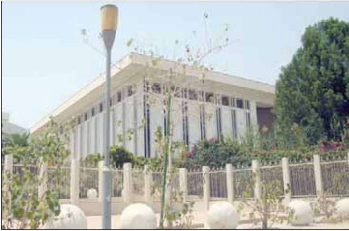
القاعدة النقدية وودائع المصارف بالمملكة ترتفع في الربع الثالث (الشرق الأوسط)

العام الحالي 2019، فقد أشارت «مؤسسة النقد» إلى تشجيعها المصارف المحلية على توجيه السيولة نحو الإقراض، مستمرة في الحفاظ على سقف الاشتراك الإسبوعي للبنوك المحلية في أذوناتها بمقدار 3 مليارات ريال خلال الربع الثالث من العام الحالي.