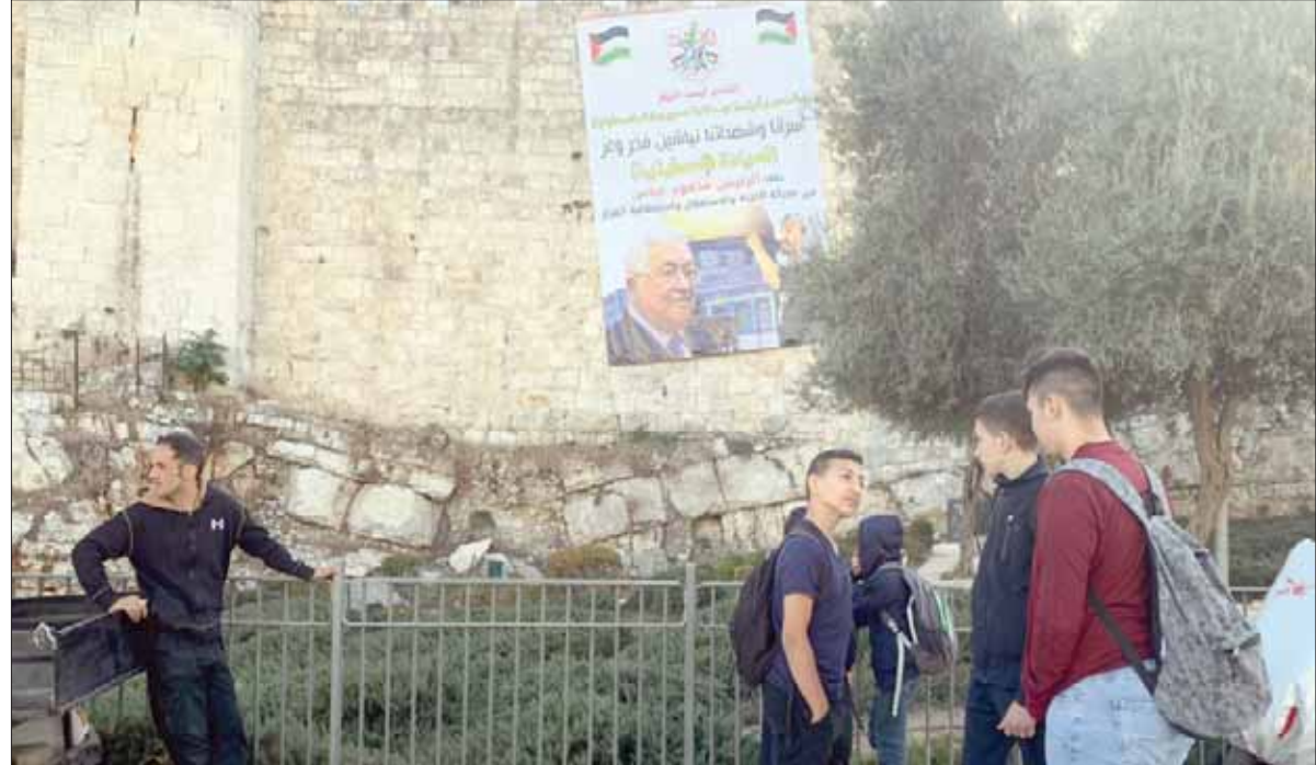
إسرائيل تزيل لافتة رفعا نشاطا على أسوار القدس كتب عليها «السيادة فلسطينية»

«حماس» تطالب بتشكيل محكمة للانتخابات تعيد «الدستورية»