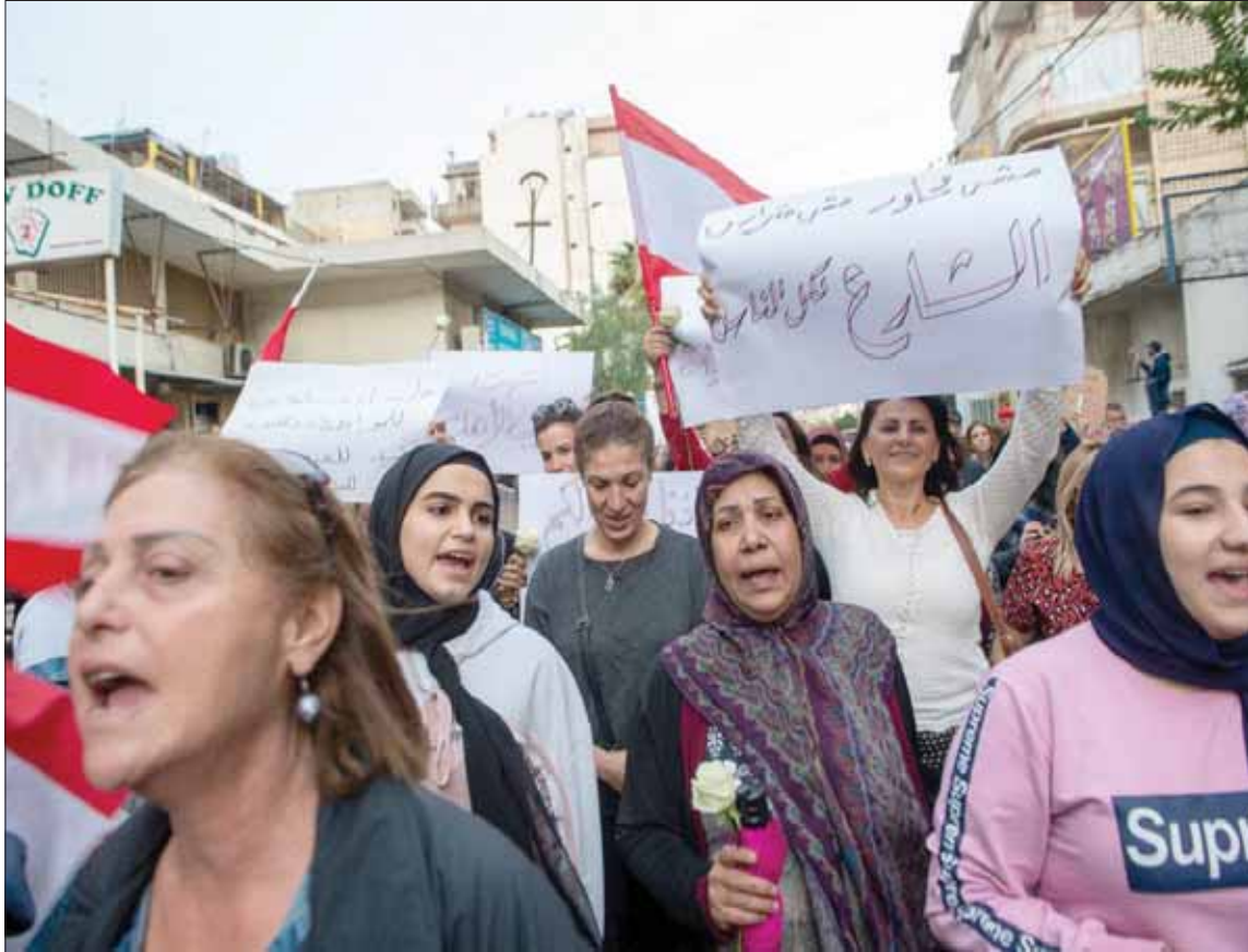
من المسيرة النسائية في منطقة الشياح - عين الرمانة في بيروت

وكما هو متوقع، تتصارع روايات أبناء المنطقتين، بحيث يتحدث أحد أبناء عين الرمانة لـ«الشرق الأوسط» عن أن «مجموعة من المخربين من الشياح هي التي حاولت اقتحام منطقتهم، في إطار