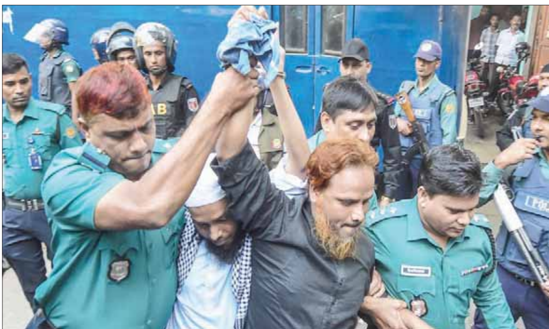
الامن البنغلاديشي يصطحب متهمين بهجوم إرهابي إلى المحكمة في دكا أمس

وأذنت أزمة الرهائن بتصعيد في هجمات المتطرفين في أعقاب سلسلة من عمليات القتل التي تنفذها «القاعدة» وتنظيم «داعش»، واستهدفت نشطاء حقوقيين وأجانب وأقليات دينية. واعتبر الهجوم بمثابة ضربة كبرى لصورة بنغلاديش، وأطلقت الحكومة حملة واسعة في أعقابها قتل خلالها أكثر من مائة متطرف واعتقل قرابة ألف آخرين. غير أن دكا لطالما نفت أن يكون شبكات إرهابية دولية تواجد في أراضيها.