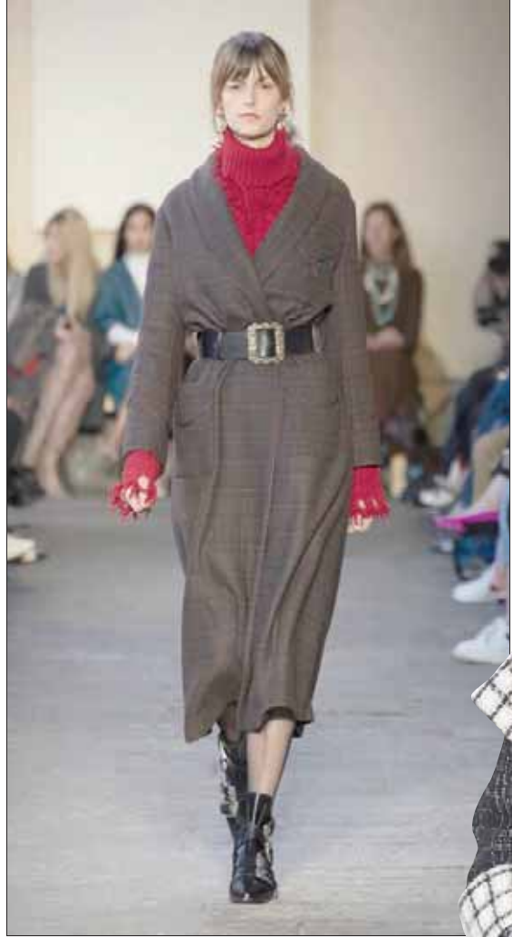
من اقتراحات «إترو»

بجرعة درامية قوية، اعتمدت فيها على حزام يحدد الصدر وأكمام منخفة. وعلامة «اغنون» أطلقت على تشكيلتها عنوان «إتيرنال»، أي للأبد، وهي التي تكونت من سترات بصفين من الأزهار من الكشمير، وباللون هادئة مثل الجملي. أما «شانيل» فقدت ملابس أكثر فخامة، حيث نجد قطعة تشبه العباءة، لكن قصيرة ومن دون أكمام من الفرو، نسقتها مع بنطلون أسود يسع بالتدرج من عند الركبة إلى الكاحل، مصنوع من الكشمير أو الصوف، وبلوزة مصنوعة من الصوف بلون الكريم، إلى جانب عدة جاكتات طويلة وأوسع. ومن جهتها، قدمت علامة «ميو» سترات مشابهة، بعضها من دون أكمام، باللون الأزرق الكحلي من الصوف، نسقتها مع قمصان برقبة عالية وربطات عنق بشكل الفراشة. ومن بين العناصر الرئيسية في هذا التيار الجديد القمصان البيضاء التي تكمل أي إطلالة مهما كانت أهميتها