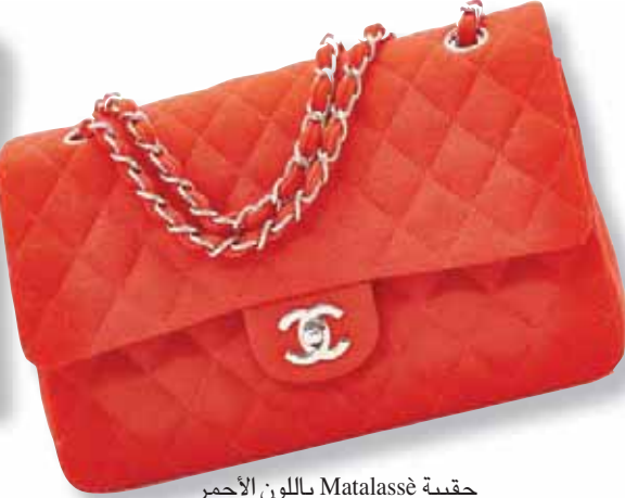
حقيقية Matalassé باللون الأحمر