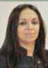
محمد زين العابدين

سيد أحمد ولد محمد، وزير التجارة والسياحة بجمهورية موريتانيا، استقبل، بمكتبه في نواكشوط، خوسيه سانتوس أكواور، سفير إسبانيا المعتمد في نواكشوط. ويحث الجانبان على تطوير العلاقات في المجال السياحي، حيث قدم السفير دعوات إلى موريتانيا ليحضر معارض دولية سياحية تقام في كل من مدريد ولاس بالماس، وإقامة يوم موريتاني في هذه المعارض للتعريف بالمنتج السياحي والوجهة السياحية الموريتانية.