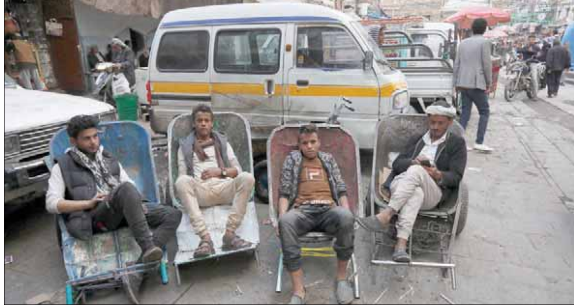
يمنيون ينتظرون من يظلمهم للعمل وسط أزمة اقتصادية خانقة في صنعاء

وذكر بيان سابق للخارجية اليمنية إن ذلك المبلغ هو إجمالي عائدات المؤسسات الإيرانية المختلفة بالبلاد؛ إذ تشمل موارد الضرائب والجمارك، فضلاً عن عائدات المؤسسات الخدمية وأرباح الشركات.