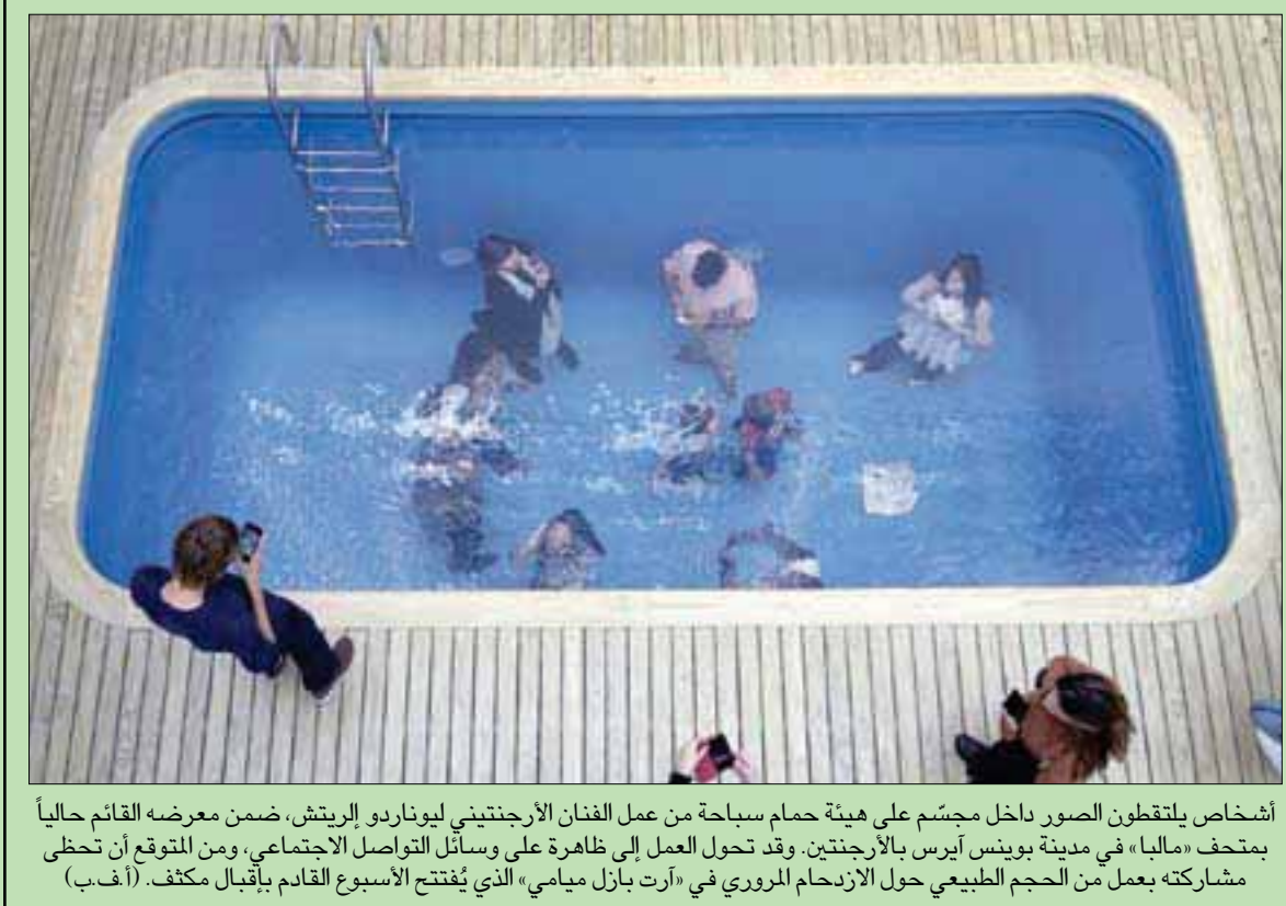
أشخاص يلتقطون الصور داخل مجسم على هيئة حمام سباحة من عمل الفنان الأرجنتيني ليوناردو إريتش، ضمن معرضه القائم حالياً بمتحف «مالبا» في مدينة بوينس آيرس بالأرجنتين. وقد تحول العمل إلى ظاهرة على وسائل التواصل الاجتماعي، ومن المتوقع أن تحظى مشاركته بعمل من الحجم الطبيعي حول الازدحام المروري في «أرت بارز ميامي» الذي يُفتتح الأسبوع القادم بأقبال مكثف.

تندن: «الشرق الأوسط» توفي أمس، الطاهي البريطاني الشهير غاري رودس، في دبي، عن عمر ناهز 59 سنة، وكانت عائلته قد أصدرت بياناً على موقع التواصل «تويتر»، نعت فيه، مؤكدة رحيله، من دون الإشارة إلى أسباب الوفاة. يعمل مع رودس عن حزنهم وأسفهم لفقدان «طاهي المشاهير»، وأسطورة الطهي والإنسان الملهم. انتقل رودس، في عام 2011 للعيش في مدينة دبي، حيث فتح العديد من المطاعم، كما أنه