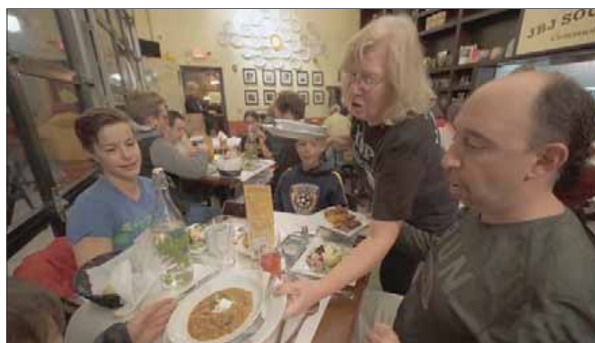
المطعم يطلب من رواده التبرع بالمال أو القيام بأعمال تنظيف في المطبخ