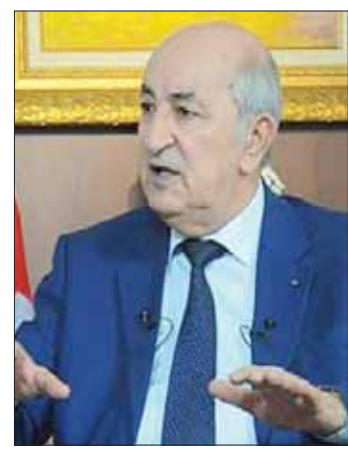
عبد المجيد تبون

رئاسة الوزراء في يونيو (حزيران) 2017. جاء فيها أنه يعترض إعلان حرب على رجال أعمال نافذين في شؤون الحكم. وكان ذلك سبباً في إبعاده بعد شهرين فقط، بحسب ما يقوله هو بنفسه. ويعتقد تبون من جهة أخرى أن مصير معقلتي الحراك، وهم المئات «بين يدي القضاء، وهو وحده المحول بتقرير مصيرهم، ألم يطلب الحراك استتقلال القضاء؟ وأنا طلبت رئاسة الجمهورية لأفقد مطالب الحراك». ويعكس ما يراه الكثيرون «اتقوف عناصر الزمامة والتنافسية في انتخابات 12 ديسمبر (كانون الأول) المقبل»، بحسب تبون، و«الإقرار بذلك كان ثورة حقيقية في المشهد الانتخابي، وذلك من خلال استحداث هيئات رقابية مستقلة للانتخابات السلطة الوطنية المستقلة للانتخابات، وفي ظل نقاش مجتمعي ديمقراطي سلمي، يبهز العالم لحد الآن».