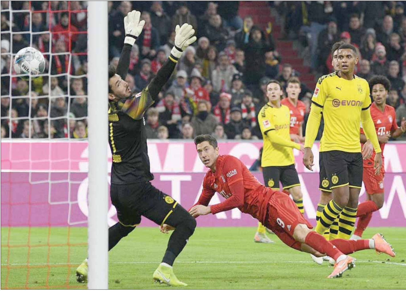
نجح ليفاندوفسكي في هز الشباك في المباريات الـ 11 التي لعبها بايرن ميونخ في الدوري الألماني ما عدا الجولة الأخيرة

ويُنسب أيضاً هذا المبدأ إلى فاردي وإيموبيلي وليفاندوفسكي، لأنهم يملكون كل القدرات والإمكانات التي تتطلبها كرة القدم الحديثة؛ القوة البدنية والذكاء الكروي ومواصلة التألق لفترات طويلة والرغبة الدائمة في التطور. وفي النهاية، يجب أن نُؤكد على أن اللاعبين الذين يلعبون في مركز رأس الحربة الصريح لم يتمكنوا من البقاء فحسب رغم تغير طرق اللعب والخطط التكتيكية، لكنهم تمكنوا أيضاً من التطور للأفضل.