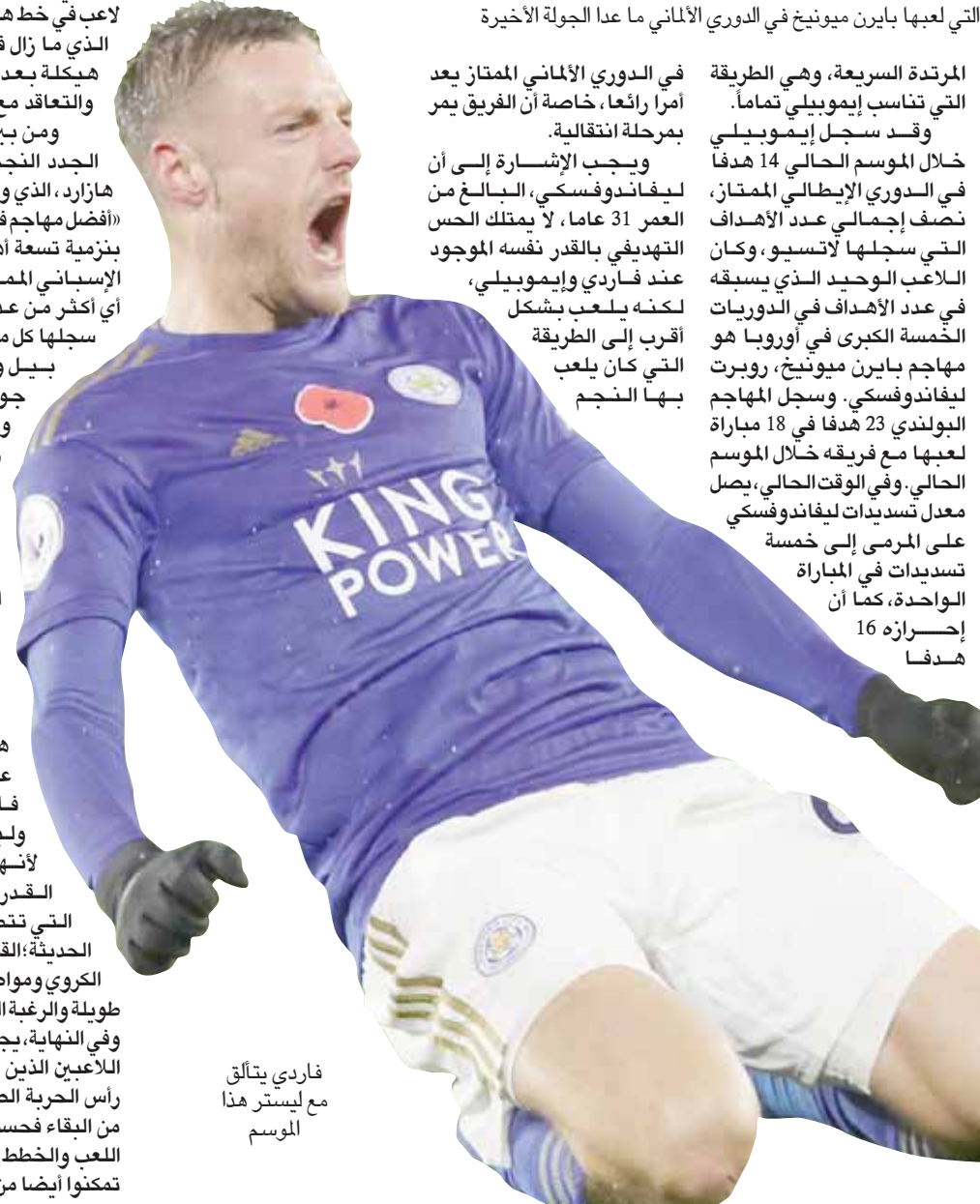
فاردي يتألق مع ليستر هذا الموسم

في الدوري الألماني الممتاز يعد أمراً رائعاً، خاصة أن الفريق يمر بمرحلة انتقالية. ويجب الإشارة إلى أن ليفاندوفسكي، البالغ من العمر 31 عاماً، لا يمتلك الحس التهديفي بالقدر نفسه الموجود عند فاردي وإيموبيلي، لكنه يلعب بشكل أقرب إلى الطريقة التي كان يلعب بها النجم