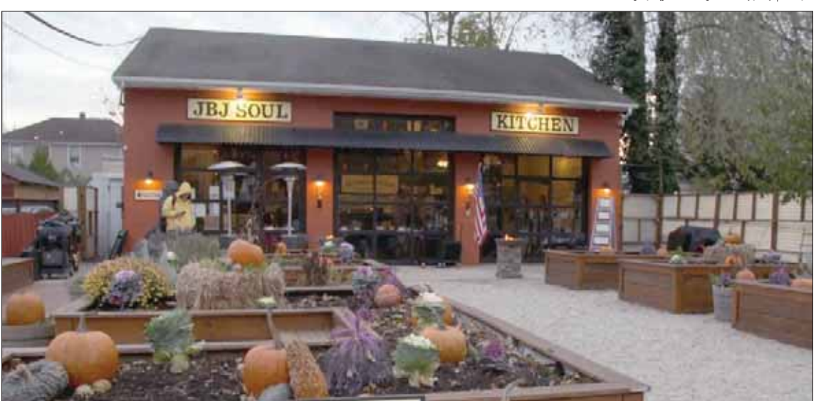
جيه بي جيه سول كيتشنز يقدم المأكولات التقليدية بمنتجات طازجة من المزرعة لمدة خمسة أيام كل أسبوع