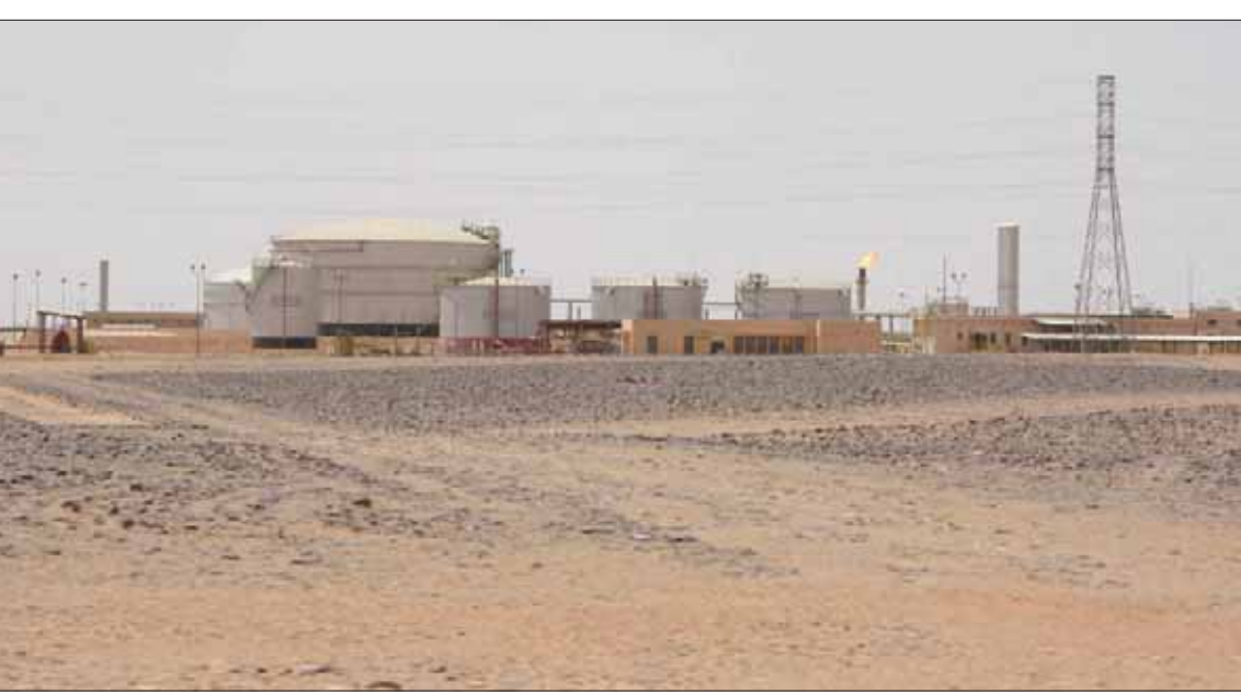
صورة لمواقع بمحيط حقل الفيل النفطي الذي تعرض لغارات مجموعات مسلحة أمس

التي تهم المنطقة، مثل الاهتمام المشترك، مثل السلام في الشرق الأوسط، والاستقرار والتنمية في أفريقيا، وكذلك الأمن الإقليمي». وجمدت العلاقات البريطة وواشنطن أيضاً التزامهما ب«توطيد الشراكة الاقتصادية وتطوير طرق مبتكرة للاستفادة من نحو 1787. ما أعلن بومبيو، مساء أول من أمس، في واشنطن. وقال بومبيو، في مؤتمر صحفي عقده مساء الثلاثاء في واشنطن: «أتطلع إلى استعراض الشراكة الاقتصادية والأمنية القوية بين بلدينا، ومناقشة مجالات التعاون المستقبلية».