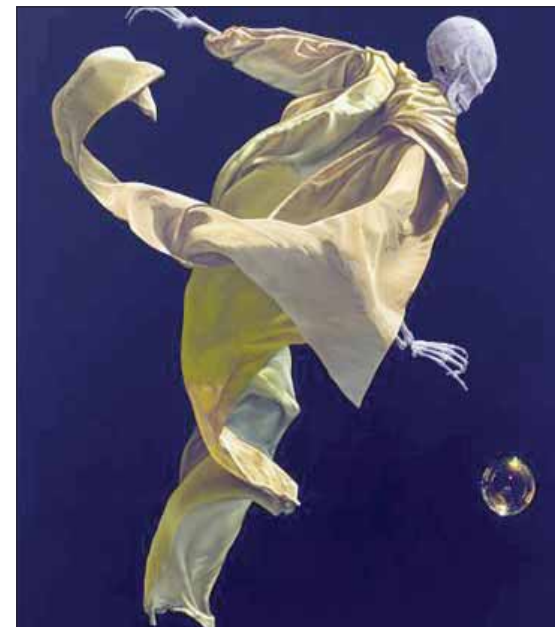
لوحة الفنانة بريجيت ستينزل

عصرية يمكن تفسيرها في إطار الحياة المعاصرة بتحويلات وتناقضاتها. ففي لوحتها «ترانسيمتر» رسمت هيكلًا عظميًا يبدو في طور التحول من جسد إلى روح مرتدياً وشاحاً يطارد فقاعة ملونة بالوان قزحية في ظلام حال، وفي لوحتها الأخرى رسمت وشاحاً أبيض يبدو عالقاً بين السماء والأرض، كأنه يعكس أطراف الشمس وأضواء القمر.