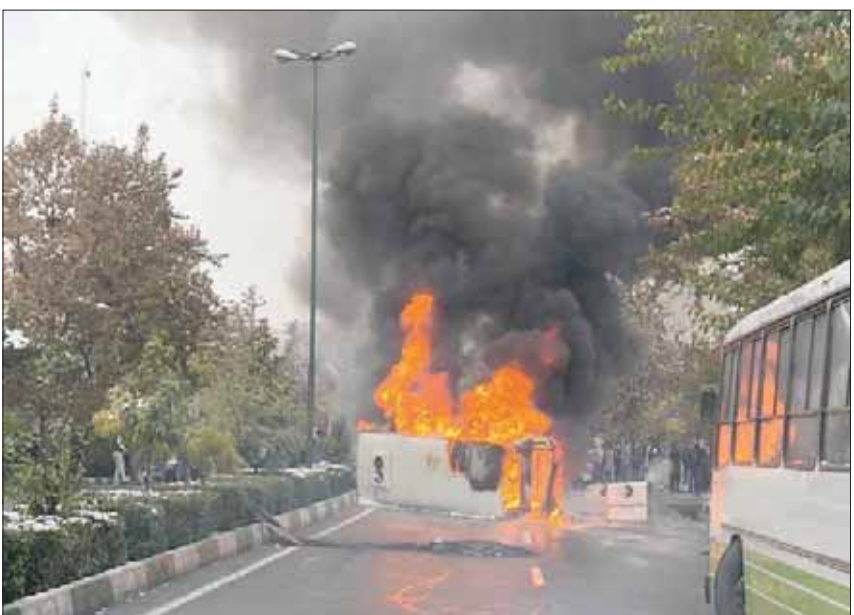
سيارة تحترق في اليوم الثاني على الاحتجاجات الإيرانية في طهران

وكان «مركز حقوق الإنسان الإيراني»، ومقره نيويورك، قال، على موقعه الإلكتروني، الأحد، إن