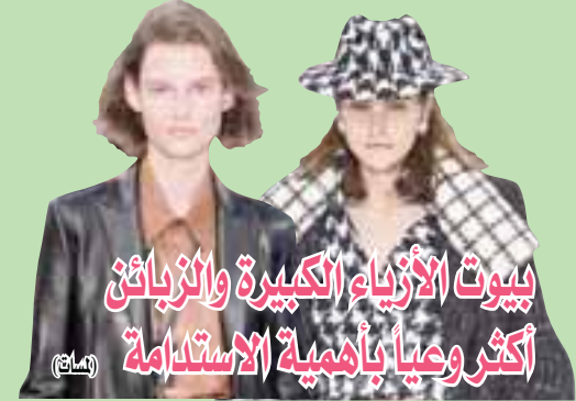
بيوت الأزياء الكبيرة والزبائن أكثر وعياً بأهمية الاستدامة