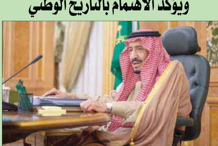
الملك سلمان بن عبد العزيز لدى ترؤسه الاجتماع 50 لجلس إدارة دارة الملك عبد العزيز

الدارة منها: الموافقة على تحويل مركز التاريخ السعودي الرقمي «رقمن» إلى المركز السعودي للمحتوى الرقمي لتحقيق أهداف الدارة المرسومة بوجود مركز مختال يحقق الشمولية في نقل المحتوى السعودي إلى الصيغة الرقمية بما في ذلك التاريخ السعودي بغرض الإفادة منه في الختبر من وسائل التواصل التقنية الحديثة. كما وافق المجلس على تنفيذ مبادرة تطوير الدراسات التاريخية الوطنية تحت إشراف الأمير محمد بن سلمان ولي العهد نائب رئيس مجلس الوزراء نائب رئيس مجلس إدارة الدارة، التي تهدف إلى تطوير جوانب المدرسة التاريخية