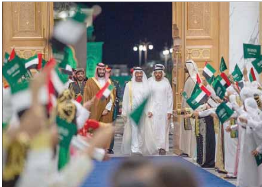
اطفال يحملون اعلام السعودية والإمارات في مراسم استقبال الأمير محمد بن سلمان والشيخ محمد بن زايد في ابوظبيي أسس (واس)

بين البلدين، ومناسبة لمواصلة التنسيق الثنائي في القضايا المحلية والإقليمية والدولية، بما يعكس توافق الرؤى والسياسات بين قيادتي البلدين.