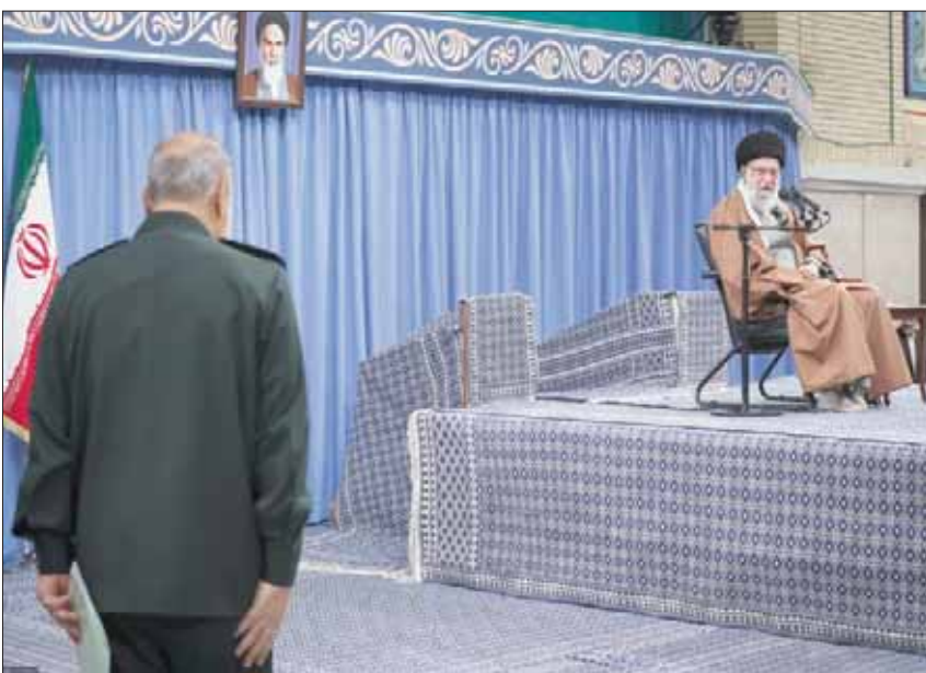
المرشد الإيراني علي خامنئي ينظر إلى قائد «الحرس الثوري» حسين سلامي في طهران أمس (موقع خامنئي)

ونسب المسؤولون الإيرانيون العنف خلال المظاهرات إلى تدخل «مثيري شغب» يدعمهم الحرس الثوري» إن قوات الأمن اعتقلت ألف شخص، من بين 87 ألف و400 شخص، نزلوا في 100 منطقة شهدت احتجاجات بانحاء البلاد. وكان حاكم طهران أعلن حينها اندلاع احتجاجات في 70