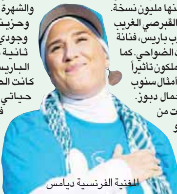
المغنية الفرنسية ديامس

لم تكن ديامس مجرد مغنية شبابية إضافية، بل كانت لها شخصيتها الجذابة ومواقفها السياسية، حيث دعمت نشاط «جمعية العفو الدولي»، وحاربت اليمين المتطرف وحزب الجبهة الوطنية الذي يناصق المهاجرين الغدء، وأسست جمعية لرعاية الأيتام في أفريقيا. وهي قد أدركت أن إظهارها لإسلامها لن يمر من دون تبعات على مهنتها الموسيقية. وحتى عندما عادت جزئياً إلى الغناء فإنها اختارت أن تكون عودتها بشكل جديد، ومن خلال الأسطوانات فحسب. وفي الصيف الماضي قالت في تصريح نشرته صحيفة سعودية إنها أنهت مهنتها الفنية على المسرح، لأنها لم تجد هدوءها النفسي فيها. وأضافت: «كل تلك الأمور، مثل النجاة والفلوس والشهرة لم تسعدني. كنت وحيدة وحزينة وأتساءل عن سبب وجودي في الدنيا». وفي مقابلة ثانية مع صحيفة «بوليت» الباريسية قالت إن «ديامس» كانت الصفحة الأولى من كتاب حياتي في طريق أتمناه مليئاً باللقاءات والمشاركة إن شاء الله». فهل يكون مشروعها الجديد من ثمار الصفحة الجديدة في حياتها؟