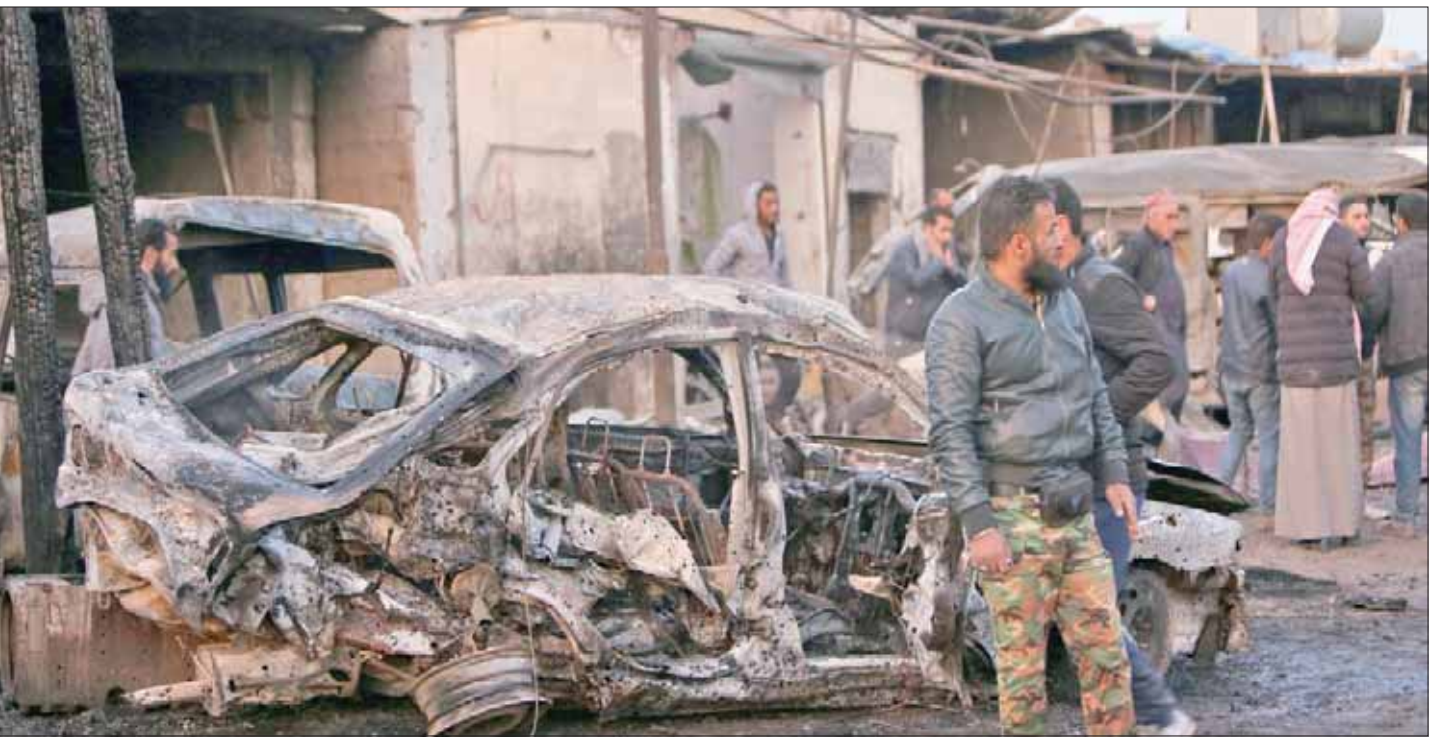
سيارة احترقت بعد تفجير في شمال شرقي سوريا

القاهرة - لندن، «الشرق الأوسط» أفاد المرصد السوري لحقوق الإنسان في ساعة مبكرة من صباح الأربعاء بأن رتلا عسكريا أميركيا آخر دخل إلى الأراضي السورية قادما من شمال العراق. وذكرت أن دخول الرتل تزامن مع تحليق طائرات حربية أميركية، وأن الرتل دخل من معبر الوليد إلى