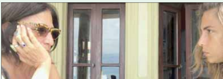
الأم والأبنة والحديث عن الجدة في «إحكي لي»

القاهرة، محمد رضا يختتم مهرجان القاهرة السينمائي الدولي دورته الحادية والأربعين يوم غد (الجمعة) بعدما جال مجدداً في عالم من الأفلام العربية والأجنبية وقدم باقة كبيرة منها في سني أقسامه مع التركيز على الأفلام التي لم تعرض من قبل عالمياً أو على نطاق دول الشرق الأوسط والمغرب العربي، والسعي لزيادة رقعة الأفلام العربية بغياب الاهتمام الكامل بها الذي كان يوفره وجود مهرجانات توقف، كما من معنا سابقاً.