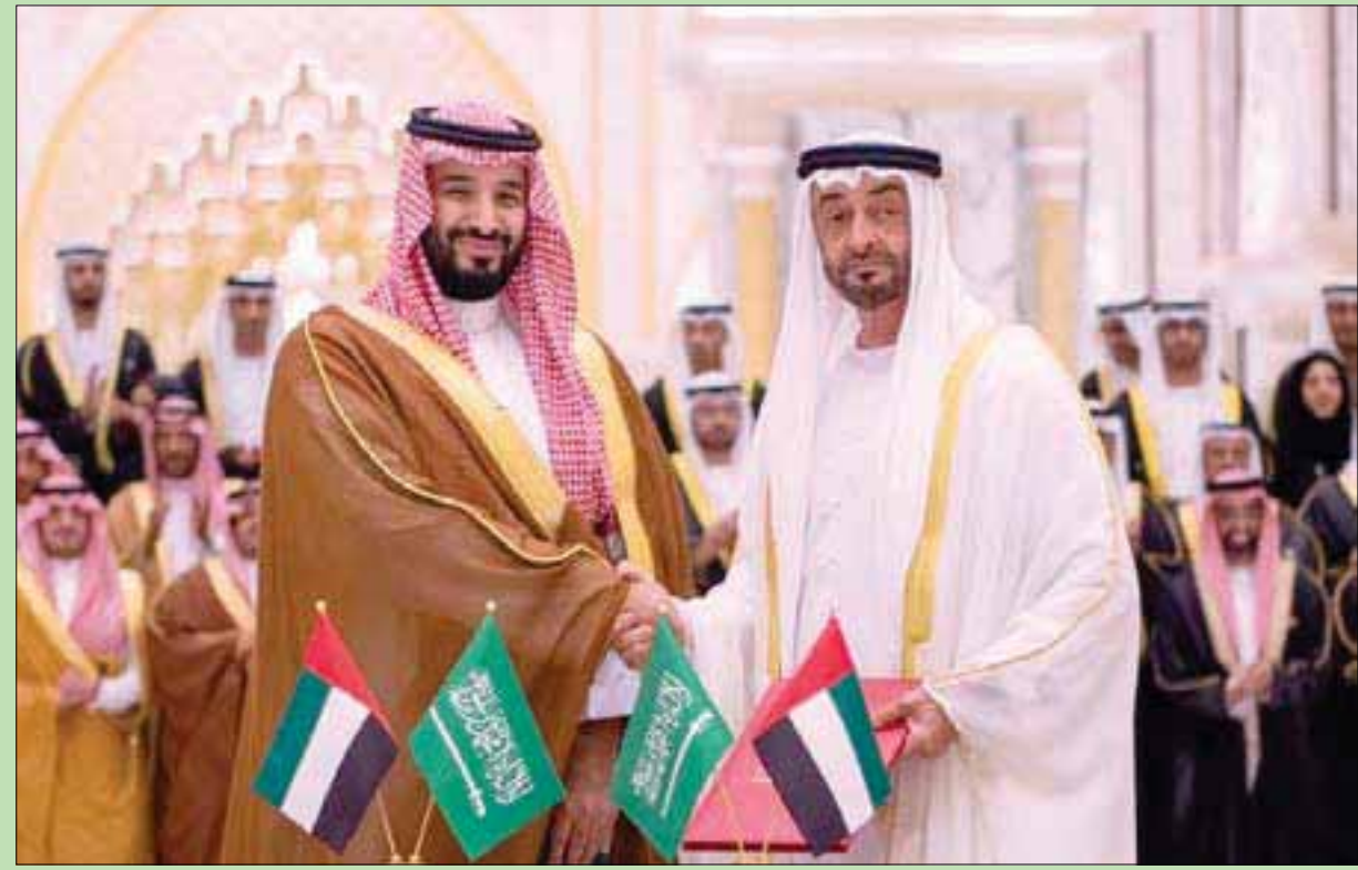
ولي العهد السعودي وولي عهد أبوظبي لدى ترؤسهما الاجتماع الثاني لمجلس التنسيق المشترك في العاصمة الإماراتية أمس (واس)

أبوظبي، مساعد الزياتي، عقدت السعودية والإمارات، أمس، الاجتماع الثاني لمجلس التنسيق المشترك بينهما، في العاصمة الإماراتية أبوظبي، حيث ترأسه الأمير محمد بن سلمان بن عبد العزيز، ولي العهد السعودي، والشيخ محمد بن زايد آل نهيان، ولي عهد أبوظبي. وشهد الاجتماع تبادل 4 مذكرات تفاهم، واستعراض 7 مبادرات استراتيجية؛ بهدف تفعيل محاور التعاون المشتركة للتكامل الاستراتيجي بين البلدين، اقتصادياً، وتنموياً، ومعرفياً، وعسكرياً. وشملت مذكرات التفاهم مجالات جديدة، هي الثقافة، والغذاء، والصحة والأمن الغذائي، بينما طالت المبادرات الدبلوماسية، والتأشيرة السياحية المشتركة، وتسهيل الإجراءات، تأتي «بناءً على توجيه خادم الحرمين الشريفين الملك سلمان بن عبد العزيز، وانطلاقاً من حرصه على التواصل وتعزيز روابط الأخوة بين المملكة ودولة الإمارات العربية المتحدة الشقيقة». الدبلوماسي الملكي في السعودية، بأن زيارة ولي العهد إلى الإمارات، تأتي «بناءً على توجيه خادم الحرمين الشريفين الملك سلمان بن عبد العزيز، وانطلاقاً من حرصه على التواصل وتعزيز روابط الأخوة بين المملكة ودولة الإمارات العربية المتحدة الشقيقة». وأفاد بيان صدر عن