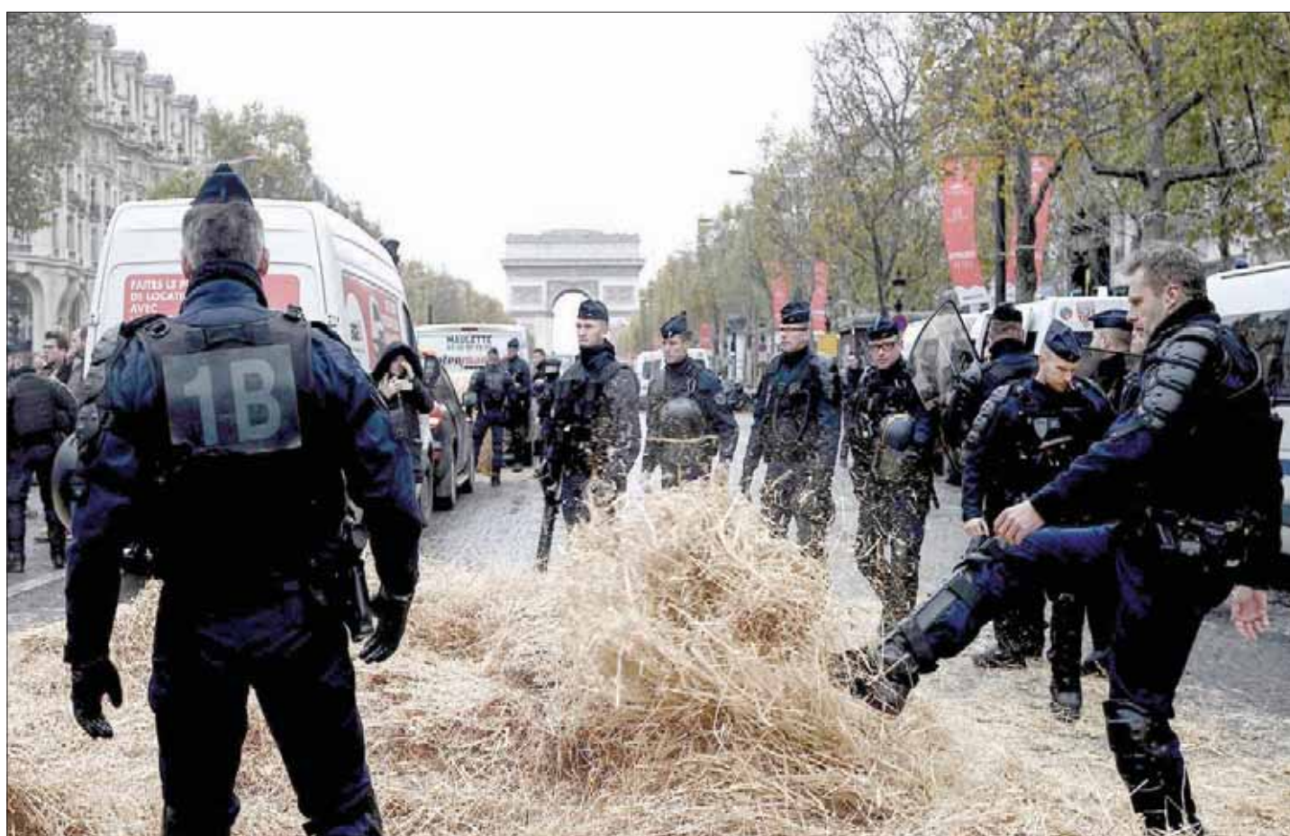
قوات مكافحة الشغب يستعدون في جادة الشانزليزية أمس

بهم القضاة والموظفون الإداريون. يوم الخميس المقبل، سيشارك المزارعون في الشوارع بالآلاف، قيساً على ما قاموا به يوم 2 أكتوبر الماضي، حيث نزل منهم 27 ألف عنصر احتجاجاً على الأوضاع المهنية، ورفضاً للمسح بامتيازاتهم. ويُنتظر أن تقفل مراكز الشرطة، وأن يمنع أفرادها عن تحرير محاضر مخالفات بحق السائقين... وهذا غضب من قبض؛ إذ يتعين إضافة المعلمين والطلاب واللامذة والممرضين والعاملين في القطاع الصحي. وإذا كان رفض مشاريع إصلاح قانون التقاعد هو الخط الجامع بين غالبية المتظاهرين، فإن التبعية المنتظرة تعكس رفضاً للسياسات التي تتبعها الحكومة. وكشف أكثر من مصدر أن ما لا تريد الدولة حصوله هو استنساخ حركة «السترات الصفراء» التي كادت تطيح بالحكومة، وربما بالرئاسة، والتي خرج منها ماكرون وحكومته ضعيفين. ولذا، فإن الحكومة تسعى لتفكيك الألعاب، ودرء المخاطر المقبلة، من خلال التركيز على رغبتها في الحوار، ولكن مع التأكيد على عزمها السير بإصلاح القانون المذكور.