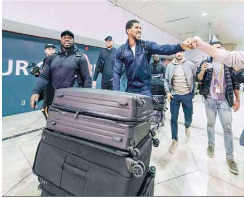
وصول الملكمان جوشوا أحد طرفي نزال الدرعية التاريخي

بكل سهولة، في حين تقدم عدد كبير من الإعلام الدولي الأجنبي بطلب تصاريح حضور وتغطية اللقاء؛ حيث بدأت الهيئة العامة للرياضة وبالتنسيق المباشر مع الشركة المسوقة للنزال بالعمل على تنسيق دخول الصحافة الأجنبية وتوفير المقاعد الخاصة بهم. يشار إلى أن ميدان الدرعية الذي سيحتضن هذا التنافس قد تم تشييده خصيصاً لهذه المناسبة في وقت زمني قصير منذ 7 أكتوبر (تشرين الأول) الماضي، وبمشاركة أكثر من 200 مهندس وخبير، على مساحة تبلغ 10 آلاف متر مربع، وتتسع المدرجات لـ 15 ألف متفرج، فيما سيخترق على تنظيم هذا الحدث أكثر من 2000 موظف.