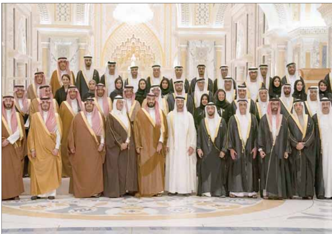
صورة جماعية للأمير محمد بن سلمان والشيخ محمد بن زايد مع أعضاء مجلس التنسيق السعودي - الإماراتي

أبوظبي: مساعد الزياتي عقدت السعودية والإمارات الاجتماع الثاني لمجلس التنسيق المشترك الذي استضافته العاصمة الإماراتية أبوظبي، وترأسه الأمير محمد بن سلمان بن عبد العزيز، ولي العهد السعودي نائب رئيس مجلس الوزراء وزير الدفاع، والشيخ محمد بن زايد آل نهيان، ولي عهد أبوظبي نائب القائد الأعلى للقوات المسلحة، والذي شهد تبادل 4 مذكرات تفاهم واستعراض 7 مبادرات استراتيجية.