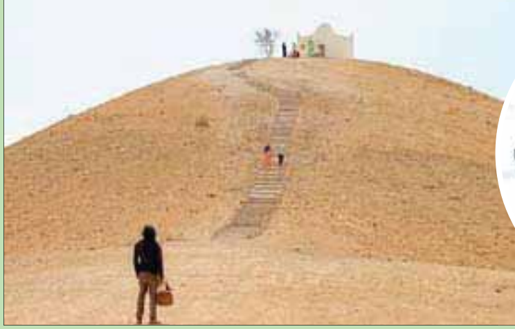
مشهد من الفيلم المغربي «سيد الجهول» المشارك في المسابقة الرسمية للمهرجان

والمخرج الأسترالي ديفيد ميتشود، والمخرج المغربي علي الصافي.