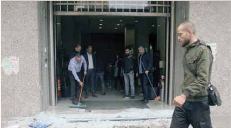
رجل ينظف الزجاج المهشم أمام فرع لأحد المصارف في طرابلس بعد ليلة العنف

بيروت، سوسن الأبطح لم يعد بمقدورهم التمييز بين من يهاجمهم ومن يواليهم. وكانت مجموعة من المنتفضين قد أصرت على نزع علم «التيار الوطني الحر» عن مبنى حزبي قريب من الساحة واصطدمت مع الجيش؛ ونشبه مهجورة، غالبية الباعة الذين يرباطون هنا، كانوا حتى الظهيرة لا يزالون يتقاعسون عن الحضور. بعض الخيم كسرهما المخربون، ولم يبق منها سوى أعمدتها العبدية. أما الصامدة على جوانب الساحة، فهجرها أصحابها إلا القليل منهم. ليل الثلاثاء لم يكن كما قبله، تعرضت ساحة الاعتصام الأشهر، التي صمدت أربعين يوماً، من دون أي حادثة مخلّة، وعرفت بانتظامها ورحابة أحوالها، لأحداث عنف وترهيب، جعلت من يرباطون هنا يشعرون بأن ثمة شيئاً تغير. يقول الشبان الجاسون في إحدى الخيم في الساحة، ويتحدثون حول ما شاهدوه، إنهم في ساعة متأخرة من ليل الثلاثاء، وكان كل شيء هادئاً، غزا الساحة عشرات لا يعرفون وجوههم من قبل، وسادت حالة من الهرج والمرج،