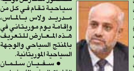
محمد زين العابدين

عصام عابد الثقافي، سفير خادم الحرمين الشريفين لدى إندونيسيا، التقى وزير الشؤون الدينية الإندونيسية، الرزازي، وذلك بمقر الوزارة. وجرى خلال اللقاء استعراض الموضوعات ذات الاهتمام المشترك وتعزيز التعاون والتنسيق في المجالات ذات العلاقة بالشؤون الإسلامية وشؤون الحج والعمرة. حضر اللقاء نائب السفير يحيى القحطاني، ومسؤولون في وزارة الشؤون الدينية الإندونيسية.