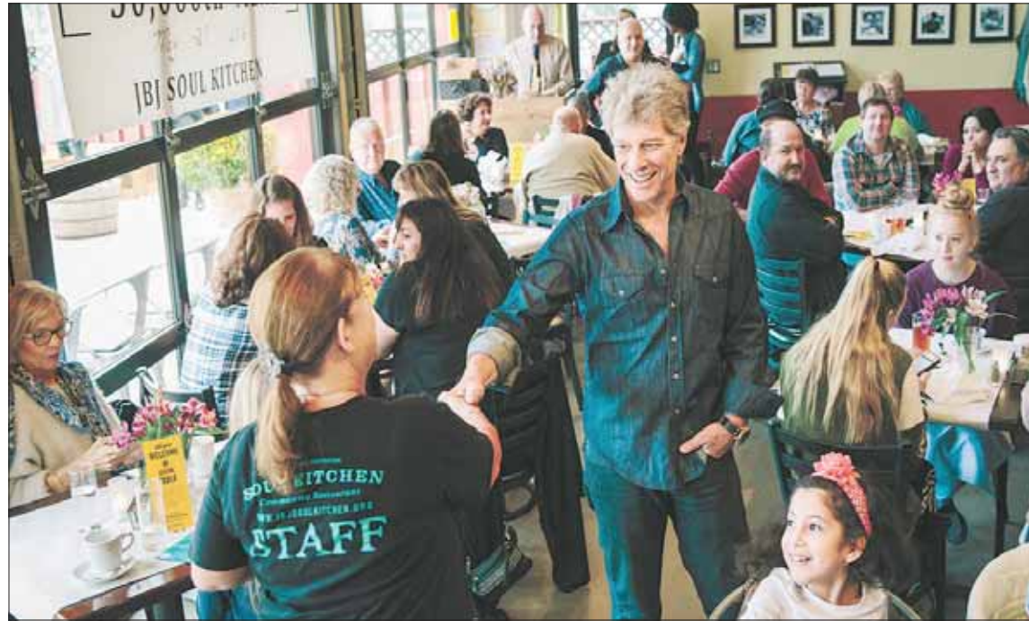
جون بون جوفي في مطعمه «سول كيتشنز» المخصص للمحتاجين

إلى نشر رسالة المطعم الخيرية ذلك لأننا قادرين على توفير الأغذية الممتازة للجميع، ولكن ما لم يأتي الطلبة لتناول الطعام عندنا، فسوف نعتبر أنفسنا من الفاشلين».