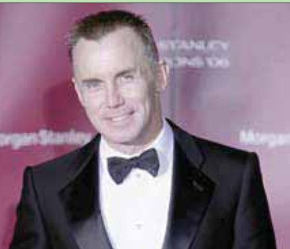
غاري رودس

تندن: «الشرق الأوسط» توفي أمس، الطاهي البريطاني الشهير غاري رودس، في دبي، عن عمر ناهز 59 سنة، وكانت عائلته قد أصدرت بياناً على موقع التواصل «تويتر»، نعت فيه، مؤكدة رحيله، من دون الإشارة إلى أسباب الوفاة. يعمل مع رودس عن حزنهم وأسفهم لفقدان «طاهي المشاهير»، وأسطورة الطهي والإنسان الملهم. انتقل رودس، في عام 2011 للعيش في مدينة دبي، حيث فتح العديد من المطاعم، كما أنه