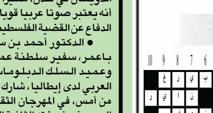
محمد زين العابدين

عصام عابد الثقافي، سفير خادم الحرمين الشريفين لدى إندونيسيا، التقى وزير الشؤون الدينية الإندونيسية، الرزازي، وذلك بمقر الوزارة. وجرى خلال اللقاء استعراض الموضوعات ذات الاهتمام المشترك وتعزيز التعاون والتنسيق في المجالات ذات العلاقة بالشؤون الإسلامية وشؤون الحج والعمرة. حضر اللقاء نائب السفير يحيى القحطاني، ومسؤولون في وزارة الشؤون الدينية الإندونيسية.