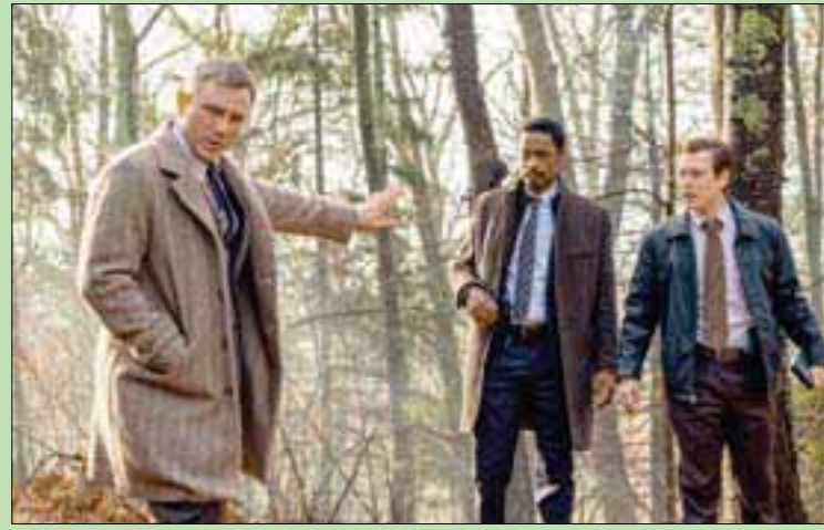
مشهد من الفيلم الأمريكي «السكاكين المشحودة» الذي يعرض في افتتاح مهرجان مراكش

من أهم رواغ الفن السابع عالمياً، ويتضمن برنامج التكريم عرض «أفلام قوية ومؤسسة تستعيد نحو خمسة عقود من الإبداع السينمائي في أستراليا»، حيث سينطلق هذا السفر عبر الزمن من 1971، بـ«يقظة وسط الربيع» لتيد كوتشيف أو «رحلة جبلية» لنيكولا روغ. وسيستجيب هذا السفر للجمهور إعادة اكتشاف أعمال كلاسيكية، مثل «ماد ماكس» لجورج ميلر، أو رواغ نادرة، مثل الشريط الشهير «نزهة في هانجنيغ» لمخرجه بيتر فير. كما سيكون رهن السينما الأسترالية حاضراً من خلال أفلام كثيرة، من قبيل «نقش» للممثل الشهير سيمون بيكر الذي انتقل في هذا الشريط إلى خلف الكاميرا؛ و«الأسد» لغارث ديفيس الذي حقق نجاحاً عالمياً كبيراً، وانتزع ما لا يقل عن 6 ترشيحات للأوسكار في 2017؛