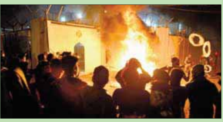
متحتجون عراقيون يضرمون النيران في مبنى القنصلية الإيرانية في النجف امس

بغداد، حمزة مصطفى لندن، «الشرق الأوسط» تواصلت أعمال العنف في العاصمة بغداد. وجاء هذا غداة تلويح رئيس الوزراء عادل عبد المهدي بإجراءات لإعادة هيبة الدولة، على حد تعبيره. وأكد عبد المهدي في كلمة له خلال جلسة مجلس الوزراء، أن الدولة لن تقف مكتوفة الأيدي أمام حالات إغلاق الطرق والتهديد وتعطيل الدراسة والجماعات من قبل المتظاهرين، محدراً من انهيار النظام، ومن صدام أهلي خطير في البلاد التي تشهد منذ شهرين اضطرابات تُعدّ الأسوأ في تاريخها الحديث. وذكر عبد المهدي أن «القوات الأمنية كانت دائماً في موقف الدفاع، حتى أمام من يحرق ويقتل، وهناك مجال ومخازن تجارية تعود للشعب أحرقت، والدافع هو بثّ الرعب والفوضى بين الناس، وهناك من يحمل السلاح ومن يقتل ولا يمكن أن نقف أمام ذلك دون معالجة، فواجبنا حفظ النظام، مثلما نحمي المتظاهرين، ولا يمكن للدولة إلا أن تدافع عن حق المواطنين». وفي خطوة غير مسبوقة، أقدم عبد المهدي على تعيين قادة عسكريين على رأس خلايا للأزمة في المحافظات المنتفضة. وتواصلت أعمال العنف في العاصمة بغداد. وجاء هذا غداة تلويح رئيس الوزراء عادل عبد المهدي بإجراءات إعادة هيبة الدولة، على حد تعبيره. وأكد عبد المهدي في كلمة له خلال جلسة مجلس الوزراء، أن الدولة لن تقف مكتوفة الأيدي أمام حالات إغلاق الطرق والتهديد وتعطيل الدراسة والجماعات من قبل المتظاهرين، محدراً من انهيار النظام، ومن صدام أهلي خطير في البلاد التي تشهد منذ شهرين اضطرابات تُعدّ الأسوأ في تاريخها الحديث. وذكر عبد المهدي أن «القوات