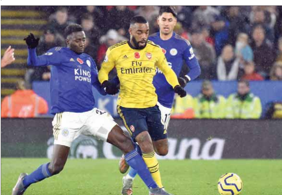
نديدي (يسار) الذي لم ينل حظه المستحق من التقدير بعد

في دور اللاعب القادر على الفوز بالكرة في قلب الملعب. وقدّم اللاعب النيجيري الدولي