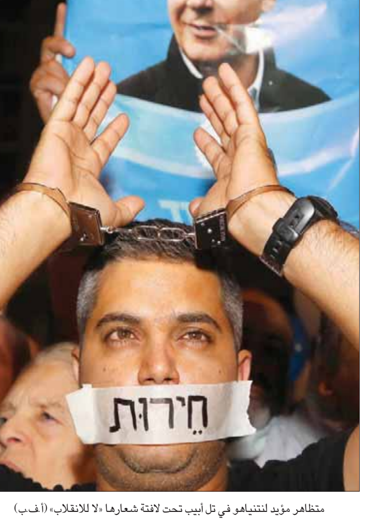
مظالم مؤيد لنتنياهو في تل أبيب تحت لافتة شعارها «لا للانقلاب»

الانتخابات وشهرين حتى تشكيل الحكومة الجديدة، ولذلك فإنه يطلب أن يوافق «كحول لغان» على بقائه رئيساً للحكومة بالاتفاق، «فقط لكي نوفر على الجمهور أعباء الانتخابات الجديدة». وقد رحب الليكود بهذا العرض ولكن غانتس رفض العرض بشكل تام وقال إن التكتل الذي يقوده هو الفائز بأكبر عدد من النواب ولذلك يجب أن تكون الحكومة برئاسة هو، مؤكداً أن نتنياهو لم يعد صالحاً لرئاسة الحكومة بسبب توجيه لوائح الاتهام ضده في بنود خطيرة، وقال إنه وجه تعليمات إلى طاقم المفاوضات باسمه أن يجتمع مع أدلشتاين ويسعى إلى حكومة وحدة بطريقة أخرى. وأضاف: «المسألة مسألة قيم ومبادئ. فلا يمكن أن نوافق على وجود رئيس حكومة في إسرائيل منهم بشكل رسمي بتلقي رشوة وخيانة الأمانة والاحتيال». وتساءل: «لماذا لا يقبلون بحكومة شراكة بيننا، نحن نتولى رئاستها نصف المدة لسنتين، وهم يأتون بعدنا؟ فإذا خرج نتنياهو بريئاً يعود إلى رئاسة الحكومة عن جدارة، وإذا أدين بالتهم يتحمل وزر أفعاله ويتولى رئاسة الحكومة شخص آخر من الليكود». وكان معهد «ميدغام»، قد نشر أمس (الأربعاء)، نتائج