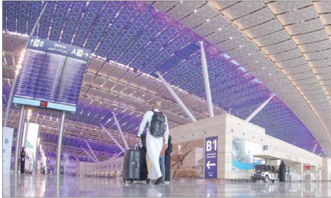
قطاع الطيران يعد أحد مستهدفات التنمية والتطوير في السعودية

الرياض، «الشرق الأوسط» كشفت هيئة الطيران المدني السعودية عن تحولات جوهرية يشهدها قطاع الطيران السعودي وتوسعتها نحو منظومة مطارات دولية، مشيرة إلى أنه تم الانتهاء من تحويل 7 مطارات محلية إلى دولية ليصبح إجمالي عدد المطارات السعودية الدولية 13 مطاراً، مقابل 3 مطارات فقط قبل بضع سنوات، في وقت أفصحت فيه عن زيادة عوائد المالية لآخر عام مالي بواقع 5 في المائة، مشيرة إلى أن السعودية ستستضيف مقر المنظمة الإقليمية لمراقبة السلامة الجوية.