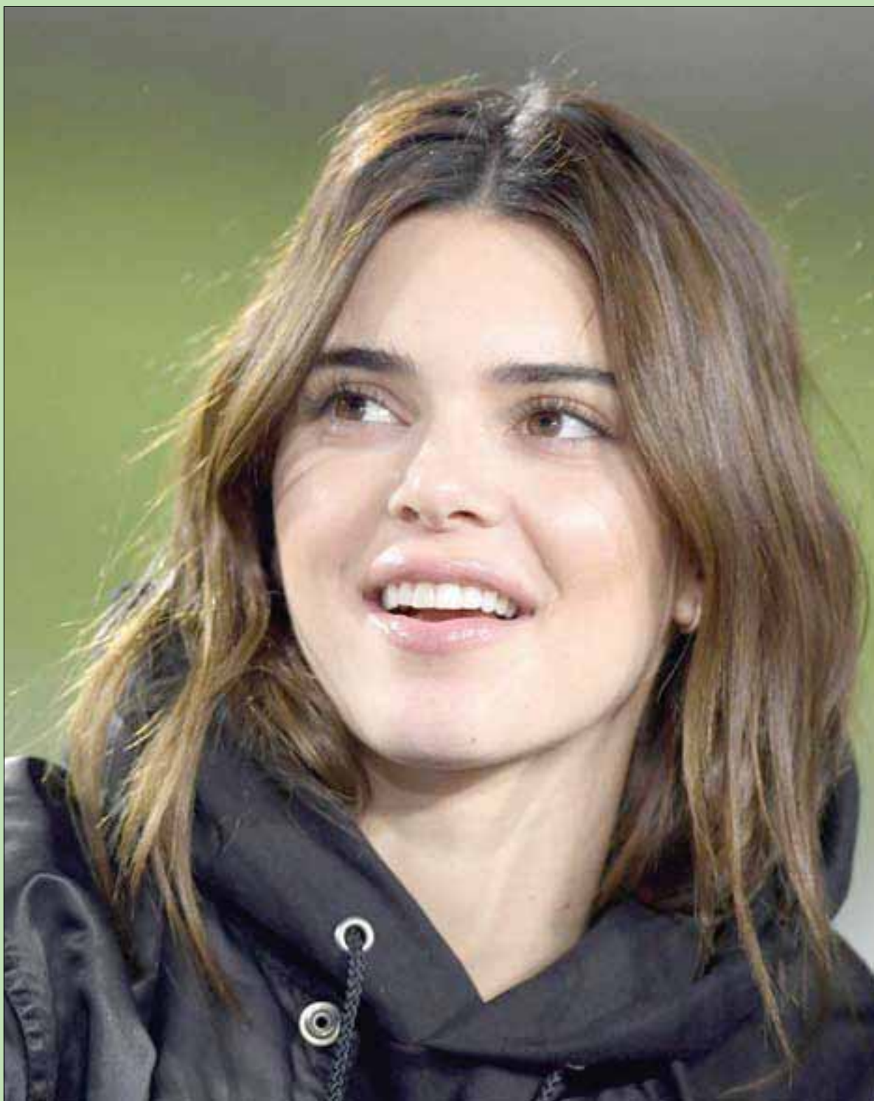
عارضة الأزياء الأميركية كيندال جينر حضرت أمس مباراة كرة قدم بين فريق لوس أنجلوس رامز وبالتيمور رافنز في لوس أنجلوس