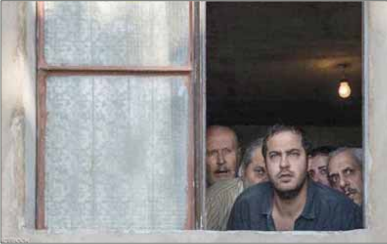
تحت الخطر في «جدار الصوت»