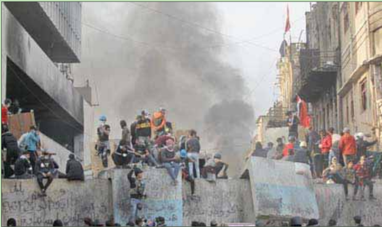
محتجون يقطعون أحد الشوارع في بغداد خلال مواجهات مع قوات مكافحة الشغب أمس