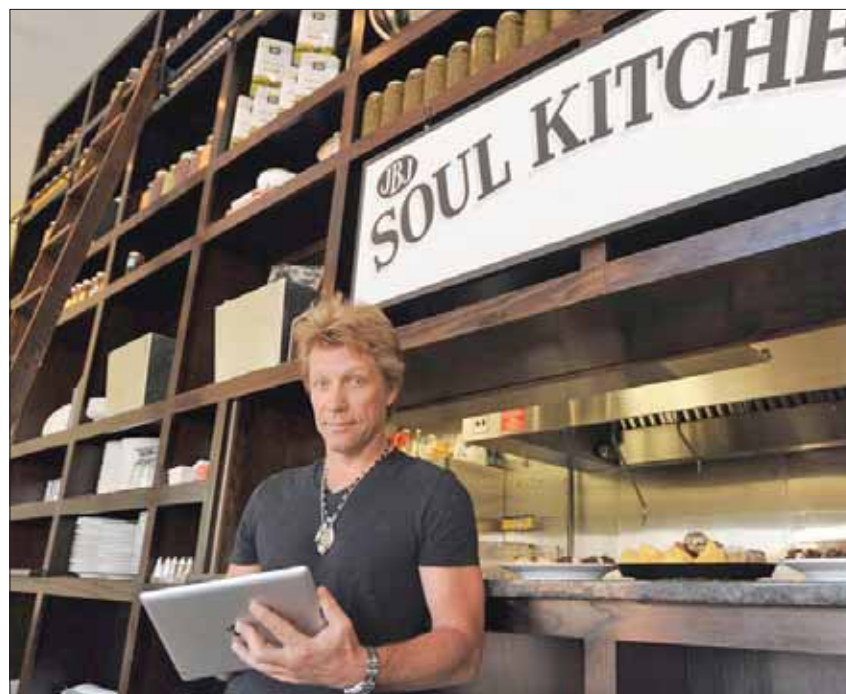
جون بون جوفي في مطعمه «سول كيتشنز»