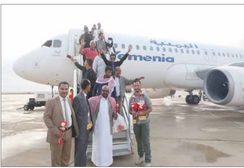
مسافرون يمنيون يلحون فرحاً باستئناف الرحلات إلى مطار الريان الدولي بالمكلا أمس