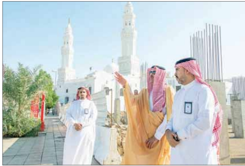
المدينة المنورة، «الشرق الأوسط»

أكد الأمير فيصل بن سلمان بن عبد العزيز، أمير منطقة المدينة المنورة رئيس مجلس هيئة تطوير المنطقة، أن مشروع تطوير مسجد القبالتين والمنطقة المحيطة به يمثل أحد المشاريع الحضارية التي تعكس اهتمام حكومة خادم الحرمين الشريفين الملك سلمان بن عبد العزيز، أمير منطقة المدينة المنورة في المجالات كافة وترسم ملامح من صور العناية والرعاية التي تقدمها في سبيل تحسين وتطوير مستوى الخدمات المقدمة للزوار.