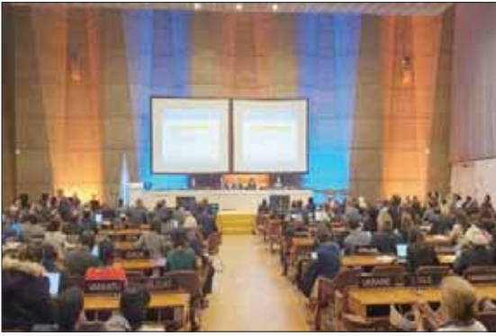
ولدت ديامس في نيقوسيا لآب قبرصي وأم فرنسية. وبدأت تؤدي أغنيات «الراب» في سن مبكرة، ولقيت نجاحاً فوراً في أوساط الشباب المهاجر. وفي عام 2006، أصدرت أسطوانة بعنوان «في قوقعتي»، بيع منها مليون نسخة. وأصبحت الشابة ذات اللقب القبرصي الغريب والمقيمة في بلدة أورساي قرب باريس، فنانة معروفة وناطقة باسم شابات الضواحي. كما راحت تخاطب النجوم الذين يملكون تأثيراً كبيراً على شباب المهاجرين، أمثال سنوب دوغ، والكوميدي المغربي جمال دونز.

ترجمة لما يحظى به القطاع الثقافي من دعم لا محدود من القيادة السعودية، وتأكيداً لثقة المجتمع الدولي بمكانة المملكة ودورها الداعم لجهود حفظ التراث العالمي وصونه. وتعنى لجنة التراث العالمي التابعة لـ «اليونيسكو»، والتي تتألف من ممثلي 21 دولة، منتخبة من قبل الجمعية العمومية، والرسوم الصحفية في جبة، والشويمس، وواحة الأحساء