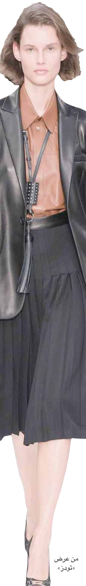
من عرض «تونز»

ولا يمكن الحديث عن هذا التوجه من دون التطرق إلى أسماء شابة تتبنى الحركة الكلاسيكية المعاصرة، وتعمل بكل قواها على بث الحياة فيها من جديد، مثل: المصمم البريطاني دانييل لي الذي أضاف لمسة مقعمة بالحويبة على دار «بوتيجا فينيتا»، من خلال فساتين أحادية الألوان، بعضها من صوف الموهير مع حزام جلدي مزود بحليات ذهبية وبعضها من الكشمير أو الحرير؛ أو المصممة إميليا ويكستيد التي رسخت أسلوبها هذا منذ عام 2008، ولم تحد عنه في أي فترة من الفترات، فمُنذ بدايتها وهي تركز على إبداع تصاميم تستثمر فيها الزبونة. وفي هذا الصدد، تشرح أن مبداءها «كان دوماً التشجيع على شراء قطع يمكن الاحتفاظ بها إلى الأبد، عوض تغييرها في موسم»، وتستدل على هذا ببدلة من «شانيل»، وكيف أنها مسن