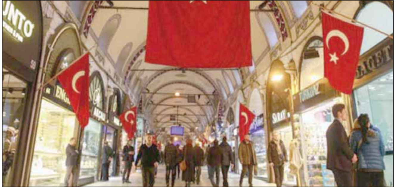
الموظفون يضطرون للاقتراض لتدبير تكاليف معيشتهم