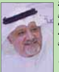
عصام عابد الثقافي

المغربية لدى مملكة البحرين، استقبله علي بن محمد الرميحي، وزير شؤون الإعلام البحريني، بمناسبة تعيينه سفيراً جديداً لبلاد. وتقدم السفير المغربي بخالص الشكر والتقدير إلى وزير شؤون الإعلام حسن استقباله واهتمامه بتعزيز العلاقات الثنائية، مؤكداً اهتمام بلاده بتوسيع مجالات التعاون بين البلدين في مختلف المجالات بما يخدم المصالح المشتركة. فيما تمنى الوزير للسفير التوفيق والنجاح في مهامه الدبلوماسية بما يدعم مسيرة العلاقات التاريخية الوطيدة بين البلدين.