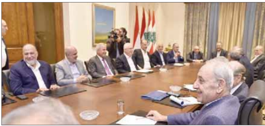
الرئيس نبيه بري مجتمعاً مع النواب أمس

وسأل: «لأن الأقران والضوابط التي تجمع الحكومة وتسير أمور البلاد والعباد بدلا من أن تبقى معلقة في الهواء الطلق».