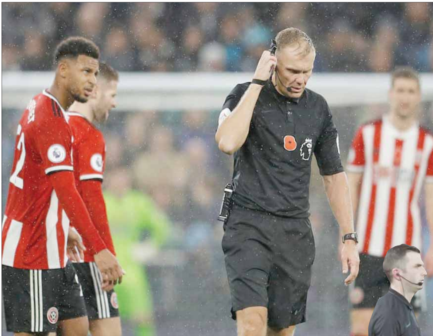
الحكم غراهام سكوت يتلقى قرار «الفار» ويغيب هدف شيفيلد يونايتد أمام توتنهام

وأضافت: «بتعهد الدوري الممتاز ولجنة الحكام بتحسين القرارات وإنجاز المهام بسرعة وزيادة التواصل مع المشجعين». وأبلغ رابلي الأندية بأن السرعة والبيانات عند اتخاذ القرار «أولوية في الحكام خبرة أكبر في التعامل مع التكنولوجيا والقواعد». وأشار إلى إمداد الجمهور بمعلومات أكبر مثل شرح أسباب مراجعة اللقطات.