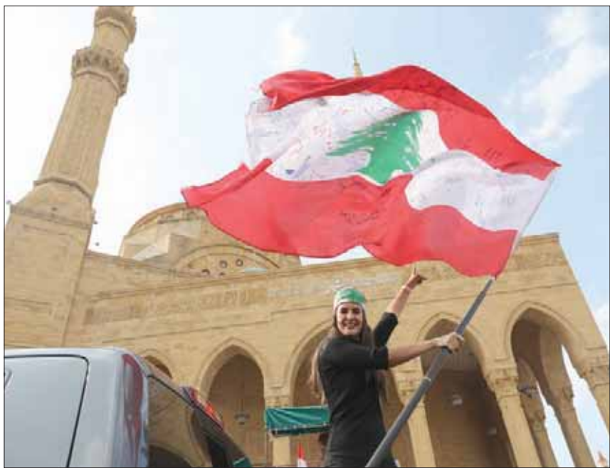
مظاهرة ترفع العلم اللبناني وسط بيروت أمس

واعتبر المتظاهرون أن «العمال جزء من انتفاضة 17 تشرين ضد النظام الرأسمالي» مطالبين بـ«رفع يد أحزاب السلطة عن الحركة النقابية، وحرية تنظيم العمل النقابي من دون ترخيص مسبق، وحق موظفي القطاع العام في التنظيم النقابي». وورع «تجمع مهنيات ومهنيين» منشوراً جاء فيه: «غاب الإتحاد العمالي العام وهيئة التنسيق النقابية عن الشارع والناس والعمال والموظفين، منذ أن وضعت قوى السلطة اليد عليهما، وأصبحت تابعين للقطاعات الاقتصادية بعد أن كانا شريكين في صناعة القرارات الاقتصادية والاجتماعية التي تتعلق بالناس».