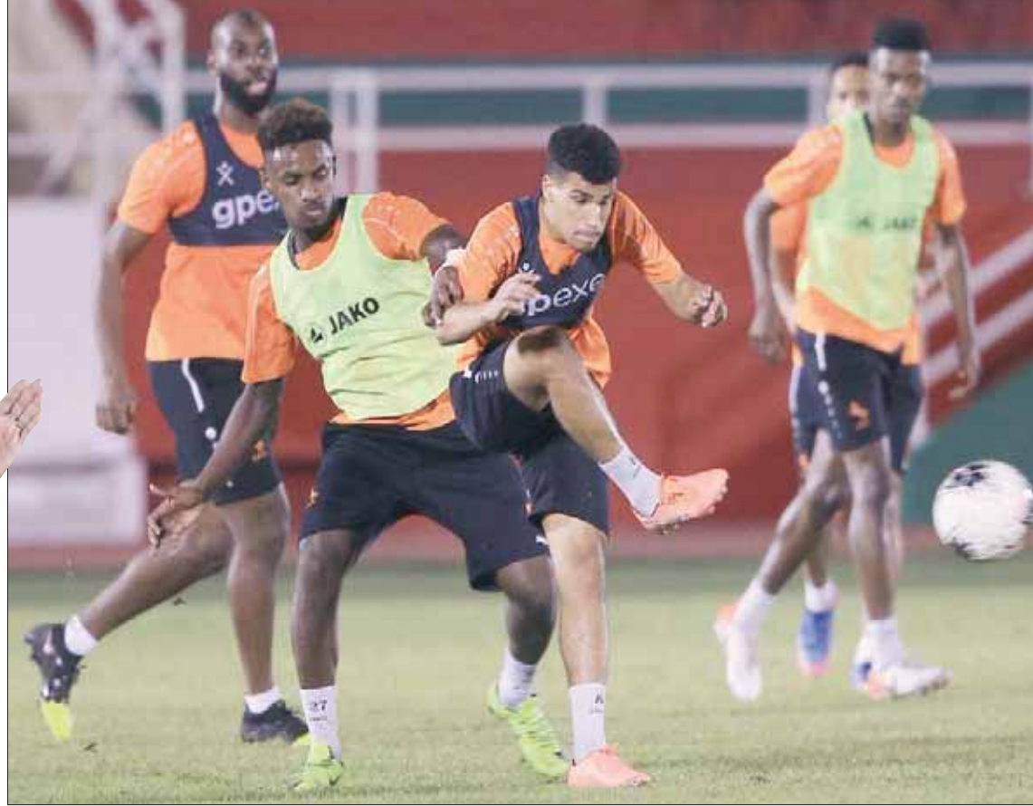
من تدريبات الاتفاق الأخيرة

الملاعب السعودية ليصحح كثيراً من الأخطاء في صفوف الفريق من أجل استعادة توازنه والابتعاد نحو مناطق الدفعة في الدوري بعد أن حصد 8 نقاط فقط أسهمت في رحيل مدربه السابق الكسندر القصري ليحل مكانه البياوي. بقيت الإشارة إلى أن فريق العدالة سيبقى في الدمام لمدة 5 أيام في معسكر بطلب من الجهاز الفني.