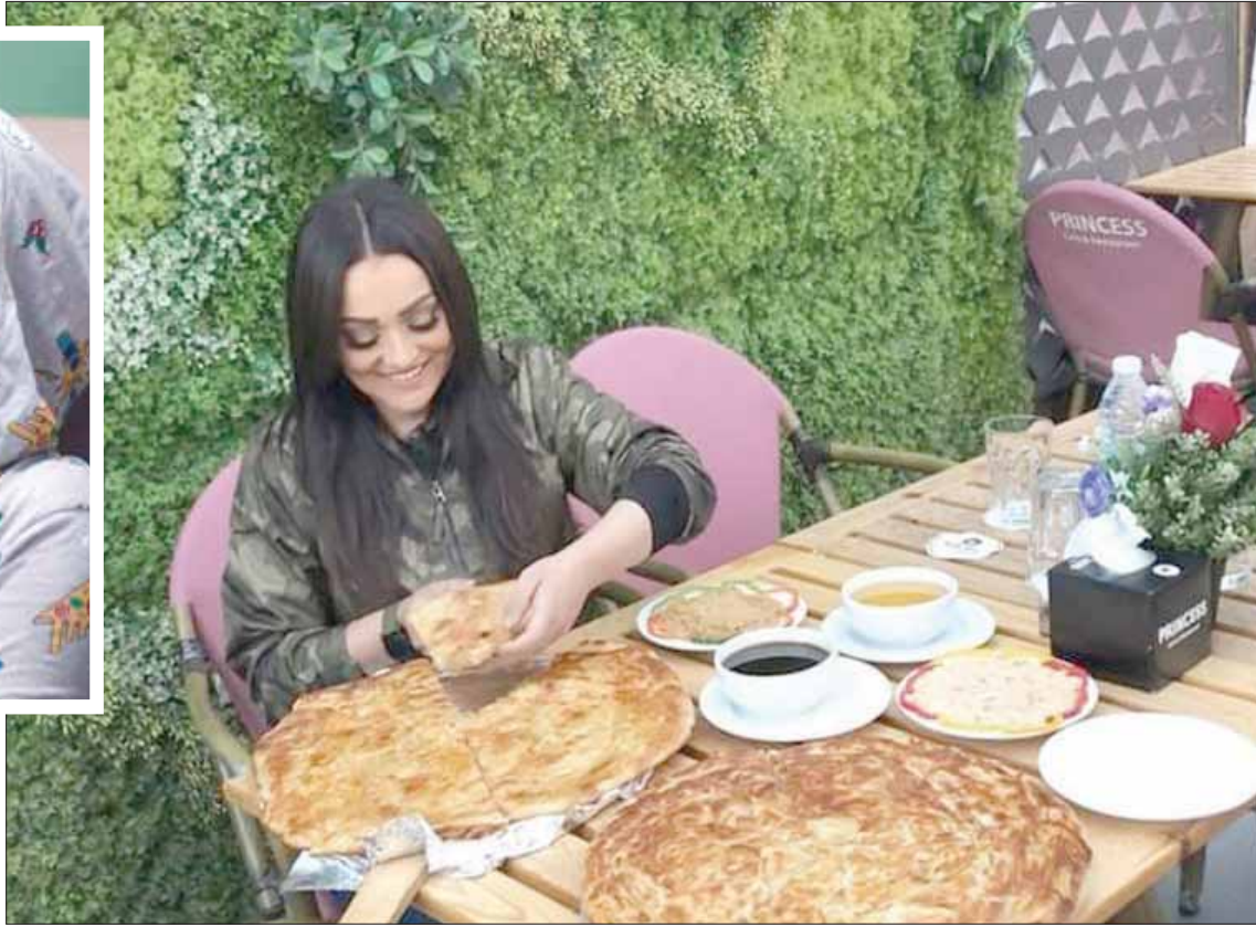
تحب الأكل الصحي ولكنها تأكل ما يحلو لها من أكلات دسمة في بعض الأوقات

«برطمانات الزيتون» وغيرها من مشتقات المطبخ اللبناني. ● على النقيض هل هناك طعام ما لا تحمين تناوله؟ - لا أستطيع تحديد أكلة بعينها، ولكن المطبخ التركي من وجهة نظري الأسوأ، كما لا أفضل أي أكلة مصرية تحمل نفس خواص الطعام التركي، وعندما سافرت إلى تركيا لم أستطع تناول الكثير من الأطعمة هناك لأنها دسمة جداً، فأغلبها مكونة من لحم الضأن، فضلاً عن عدم تقبلي أيضاً للمطبخ التايلاندي، وأذكر أنه عندما