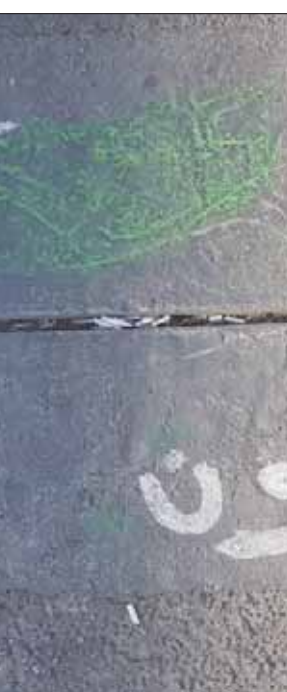
شعار مناهض لإيران حطتُ المحتجون على أرضية نفق ساحة التحرير ببغداد (الشرق الأوسط)