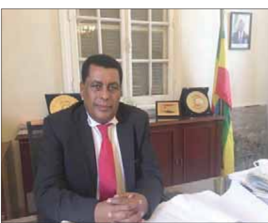
السفير الإثيوبي في القاهرة دينا مفتي

للإجماع على أنه في حال لم يتم الاتفاق قبل يناير 2020. فسيتم تطبيق «المادة العاشرة من إعلان المبادئ، والخاصة بطلب الوساطة». وبشأن مشاركة «البنك الدولي» في المحادثات، قال مفتي، لـ«الشرق الأوسط» إن «البنك الدولي» مهمته مساعدة التنمية في الدول عبر توفير التمويل. وعليه، يوجد مراقبون لمتابعة ما يحدث، وإذا احتجنا إليه يمكننا الاستعانة به في جولة أو أخرى لأن بمقدوره دعمنا بالمال، وعليه، فإن وجوده لن يكون مشكلة». وعندما سُئل مفتي، عن تقديره إلى سفير مصر عنه المسار الجديد للتفاوض، أجاب: «هذه مناقشات سياسية بوجه عام، حول كيف يمكن لمصر وإثيوبيا الوقوف في صف واحد. وأمريكا صديقة لأطراف المشاركة الموارد المائية، وبمشاركة ممثلي أميركا والبنك الدولي، وتنتهي باتفاق حول ملء وتشغيل السد، بحلول 15 يناير (كانون الثاني) 2020». ولم يظهر مفتي، انزعاجاً من الدور الأميركي في المفاوضات، لكنه سعى خلال المقابلة إلى التقليل من أهمية مبدأ الوساطة والتأكيد أنه كان يُفضل شخصياً «أن نحل هذا الأمر بأنفسنا»، وكذلك لم يبد مهتماً باسم الوسيط، وهو ما عبر عنه بقوله: «إننا أصدقاء مع الصينيين والروس والأميركيين، ما يهم حقاً هو ما نفعله نحن، وليس هم، لأننا من يتعين علينا العيش معاً، والمنا ماؤنا وليس ماءهم (...) وينبغي علينا أن نظهر استقلاليتنا، وأننا أمتان راشدتان كبيرتان، خاصة أن مصر وإثيوبيا دولتان تاريخيتان. لذا، كان أجدر بنا تسوية المسألة دون معاونة من أحد، لكن لو أن جهة ما عرضت المساعدة فلم لا نقبلها». واختلفت مصر وإثيوبيا، بشأن إدخال «وسيط» دولي للتفاوض ورفضته أديس أبابا، لكنها عادت وقبلت بدعوة واشنطن مع التمسك بأنها مناقشات برعاية أميركية وليست «وساطة»، ونص البيان المشترك