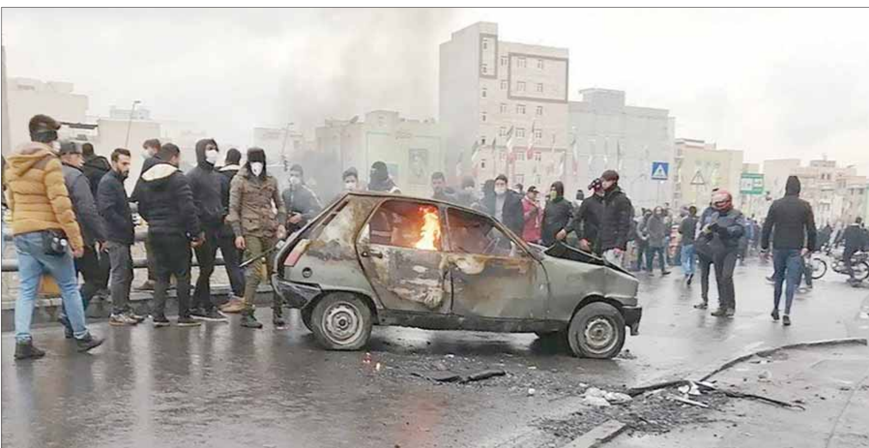
جانب من الاحتجاجات في طهران أمس

وقالت وكالة الأنباء الإيرانية الرسمية إن المظاهرات كانت «كبيرة» في مدينة سرجان حيث «هاجم أشخاص مستودعاً للوقود في المدينة وحاولوا إحراقه»، لكن الشرطة تدخلت لمنعهم... وتابعت أن الاحتجاجات اقتصر على تعطيل حركة السير، فيما حاول عشرات من المتظاهرين إضرام النار في محطات الوقود وخرانات البنزين. ونقلت وكالة «إيسنا» الإيرانية عن متحدث باسم إدارة المدينة قوله إن الشرطة و«الحرس الثوري» اضطرت للتدخل. وفي غضون ذلك أطلق مسؤولون إيرانيون تحذيرات شديدة للجهة للمحتجين تهددهم بأن الأجهزة الأمنية ستتخذ لهم بالحزم اللازم، فيما أعلن بعض النواب في البرلمان عزمهم إقناع البرلمان والحكومة بمراجعة الزيادة في أسعار الوقود. وفي المقابل