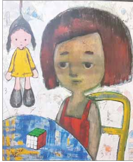
اللوحات بمثابة جسر يعيد الكبار إلى مرحلة صافية وصداقة من حياتهم

ويتيح هذا النظام تقيع تناول اللحوم والأسماك والدواجن والخضراوات غير النشوية، وهو ما يساعد على