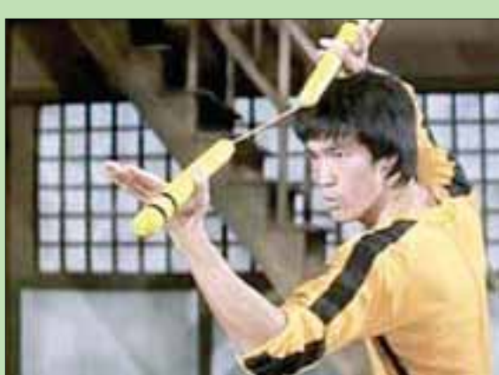
مهارات بروس لي لم تكن متوقعة

«أدخل التنين» هو من بين أنجح أفلام الكاراتيه قاطبة، وبالتالي أنجح فيلم قام بروس لي بطولته. وجمعت له ممثلين أميركيين، هما جون ساكسون وجيم كلي. الأول (انتهى مؤخراً من تصوير فيلم «أجلب لي رأس لانس هنريكسن») لم تكن لديه أي دراية بلعب الكاراتيه أو بالكونغ فو وطريقة تنفيذ المشاهد التي تصوره في الحلبة تفضح ذلك. لكن جيم كلي، كان ممارساً لتلك الفنون. أفرو - أميركي لديه خبرة مارسها في أكثر من فيلم، وكان بدأ التمثيل سنة 1972 ما يجعله «أدخل التنين» فيلمه الثاني. كلاهما أميركي يقف إلى جانب بروس لي في محاولة فهم ما يدور فوق جزيرة صينية يملكها شيرر اسمه هان (كين شيه) المسلح بيد ذات قفاز حديدي تنتهي بمخالب. وهو يقم حفاً سنوياً لألعاب الكاراتيه ولديه جيش من المتدربين في هذا القتال. لكن لي يشارك في الحفل السنوي لا للعب فقط، بل للكشف عن التجارة السرية التي تشكّل عصب أعمال الشيرر الصيني بعدما دفعت شقيقته حياتها ثمناً وهي تهرب من رجاله. وكما يعرض الفيلم، نجد الكثير من الفتيات سجينات تمهيدا للانجارج بهن. قبل ذلك يبدي لي مهارته ضد لاعبين خطيرين، هما بولو (بولو يونغ) وهو صيني يلعب شخصية سادية لا تمتنع عن القتل حتى خلال التمارين،