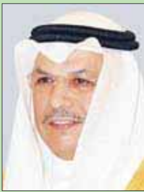
الشيخ خالد الجراح الصباح وزير الدفاع

وكان الشيخ ناصر صباح الأحمد وزير الدفاع، قد قال،