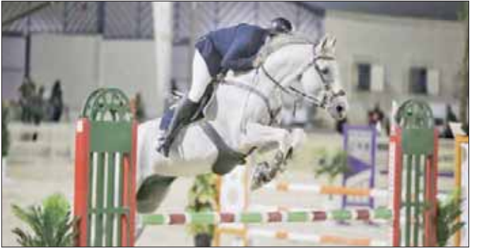
الملكة نالت شرف استضافة نهائي كأس العالم لفقر الحواجز والترويض (الشرق الأوسط)

ويأتي هذا الاختيار تأكيداً جديداً على ما تحظى به المملكة من ثقة كبيرة في استضافة الأحداث الرياضية العالمية، بفضل ما تمتلكه من إمكانيات وقدرات مكنتها من المنافسة والنجاح في كسب حقوق واحدة من بطولات الفروسية الدولية. وبهذه المناسبة، أعرب الأمير عبد العزيز