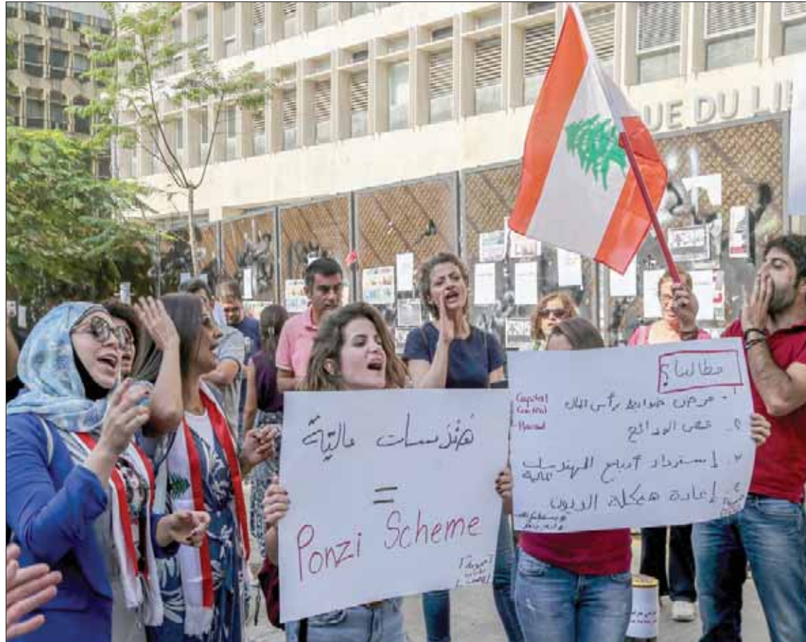
تظاهرة أمام مصرف لبنان للاحتجاج على السياسات الاقتصادية

مصرف لبنان تشكل نحو 68,5 في المائة من إجمالي موجودات المصارف، أي ما يوازي أكثر من 8 أضعاف رأس مالها الأساسي، البالغ نحو 19 مليار دولار، بينما تزيد وتيرة تقلص قدرات الجهاز المصرفي على استقطاب رساميل وودائع خارجية جديدة، وينكمش التسليف لقطاعات الإنتاج بنسب متدربة صعوداً، فأدت في المائة، إضافة إلى شح السيولة بالعملة، مقابل تمرکز نحو 75 في المائة من إجمالي المصرفية بالدولار، من إجمالى نماهز 170 مليار دولار. الخطوة الأولى الأكثر إلحاحاً، وفقاً لقناعة الخبراء وانسجاماً مع توجهات المؤسسات المالية الدولية المعول عليها في مد يد العون، هي تشكيل حكومة سريعاً تتسجم مع تطلعات جميع اللبنانيين. ومن ثم، التركيز على عوامل الاستقرار والنمو من خلال اتخاذ إجراءات محددة زمنياً لمعالجة أي اختلالات خارجية، وتحسين فرص النمو من خلال الاستثمارات وخلق فرص العمل، والتصدي للفتواتر الاقتصادية، ومكافحة الفساد، وضمان حكومة شفافة خاضعة للمساءلة. وفي التجربة، يحوز القطاع المالي المحلي خبرات مشهودة اكتسبها في محطات مفصلية سابقة في إدارة التعامل، مع ظروف طارئة ومفاجئة.