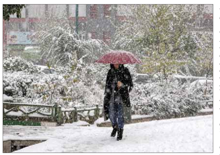
أحد الشوارع في شمال طهران أمس