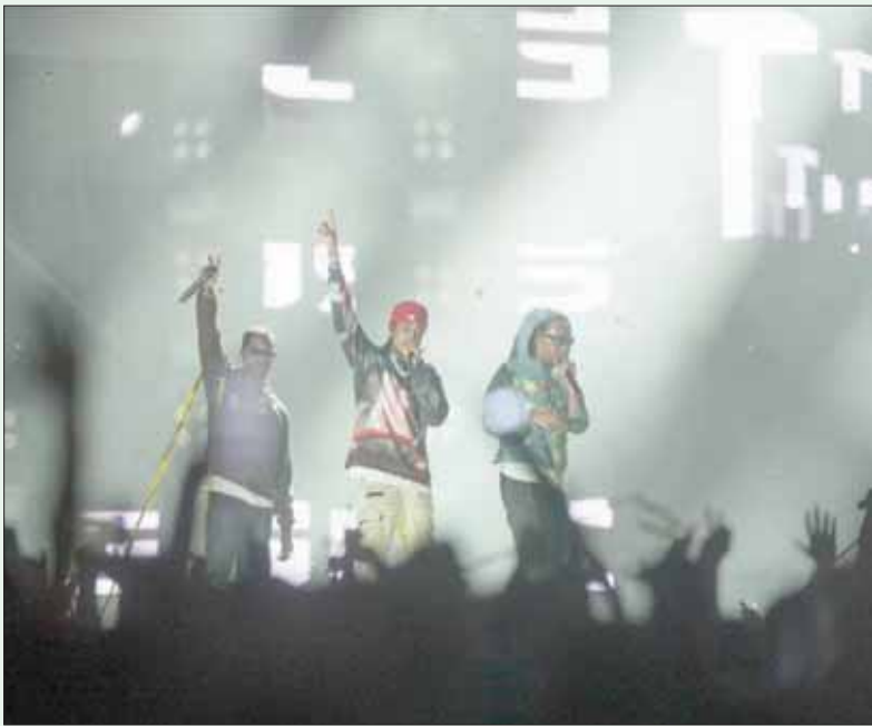
فرقة الهيب هوب خلال مشاركتها في الحفلة (الشرق الأوسط)

الرياض: «الشرق الأوسط» ثم ظهر على المسرح نجم الراقص الأمريكي Russ، ليقدّم تحية خاصة للجماهير السعودي، معبراً عن سعادته بوجوده في موسم الرياض، ليلهب حماس حضور المسرح ليتفاعل بشكل كبير مع موسيقى الراقص التي يقدمها. وجاء ختام الأمسية بحضور فرقة الهيب هوب ميغوس Migos، التي أشعلت كذلك حماس الجماهير، مرددين معها أبرز أعمالها، التي يأتي منها أغنية fight night التي أطلقوها عام 2014. وأحد أغانيهم walk it talk it. يذكر أن تذاكر الحفلة قد نفذت بشكل كامل خلال ساعات قليلة من طرحها للبيع، قبل فترة طويلة من إقامتها، ويقدم موسم الرياض عدداً من الأمسيات العالمية التي تستقطب أشهر الموسيقيين العالميين.