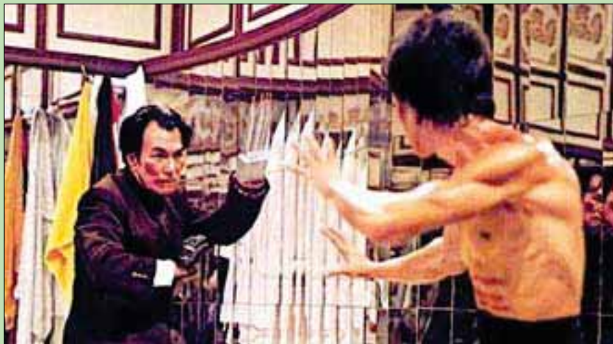
من مشهد الصراع الأخير في فيلم «أدخل التنين»

«أدخل التنين» هو من بين أنجح أفلام الكاراتيه قاطبة، وبالتالي أنجح فيلم قام بروس لي بطولته. وجمعت له ممثلين أميركيين، هما جون ساكسون وجيم كلي. الأول (انتهى مؤخراً من تصوير فيلم «أجلب لي رأس لانس هنريكسن») لم تكن لديه أي دراية بلعب الكاراتيه أو بالكونغ فو وطريقة تنفيذ المشاهد التي تصوره في الحلبة تفضح ذلك. لكن جيم كلي، كان ممارساً لتلك الفنون. أفرو - أميركي لديه خبرة مارسها في أكثر من فيلم، وكان بدأ التمثيل سنة 1972 ما يجعله «أدخل التنين» فيلمه الثاني. كلاهما أميركي يقف إلى جانب بروس لي في محاولة فهم ما يدور فوق جزيرة صينية يملكها شيرر اسمه هان (كين شيه) المسلح بيد ذات قفاز حديدي تنتهي بمخالب. وهو يقم حفاً سنوياً لألعاب الكاراتيه ولديه جيش من المتدربين في هذا القتال. لكن لي يشارك في الحفل السنوي لا للعب فقط، بل للكشف عن التجارة السرية التي تشكّل عصب أعمال الشيرر الصيني بعدما دفعت شقيقته حياتها ثمناً وهي تهرب من رجاله. وكما يعرض الفيلم، نجد الكثير من الفتيات سجينات تمهيدا للانجارج بهن. قبل ذلك يبدي لي مهارته ضد لاعبين خطيرين، هما بولو (بولو يونغ) وهو صيني يلعب شخصية سادية لا تمتنع عن القتل حتى خلال التمارين،