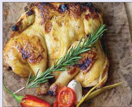
من الأطباق التي تعلم خلال جلسات الطهي