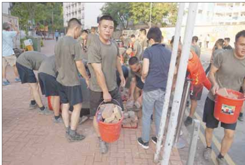
جنود من جيش التحرير الشعبي يخرجون من تكتاتهم لمساعدة سلطات المدينة في تنظيف شوارعها

«يجب ألا يشارك الموظفون المدنيون في أي أنشطة غير قانونية، بما في ذلك التجمعات الاحتجاجية غير القانونية». وتوظف الخدمة المدنية نحو 175 ألف شخص، حسب بيانات حكومة هونغ كونغ، أي نحو 4.4