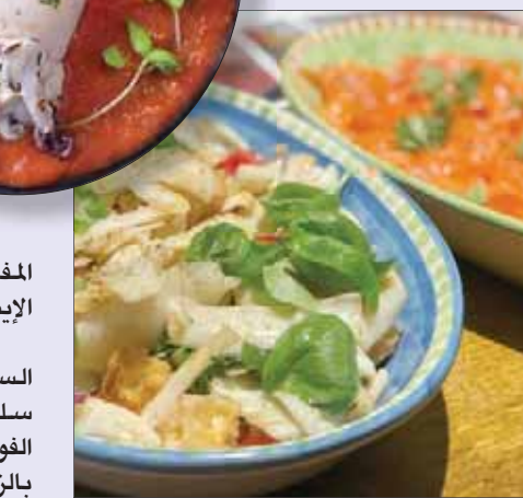
سلطة السمك وفيليه السلمون

الكثير من الموجودين يهتمون للطهي ويسعون لتطبيق أسرار المهنة في مطابخهم وهذه هي الفكرة من وراء مدارس الطهي التي تكون تابعة لمطاعم شهيرة حول العالم. وفي نهاية اليوم توزع أوراق على المشاركين فيها جميع الوصفات التي قاموا بتحضيرها خلال الدرس. الحجز المسبق ضروري والسعر 95 جنيهًا إسترلينيًا للشخص الواحد ويمكنه اصطحاب صديق لقاء مبلغ 35 جنيهًا إضافيًا.