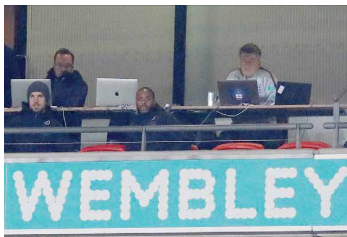
سترلينغ يتابع مباراة مونتينيغرو من المدرجات

وهذه هي النقطة الرئيسية؛ حيث يمتلك المنتخب الإنجليزي الآن مديراً فنياً ممتازاً، يقسم الجانب الآخر، يجب تحذير العلاقة المتغيرة بين اللاعبين والمدير الفني، وبين النادي والممثل الوطني، وبين وضع النجم في ناديه وطبيعة العمل في صفوف المنتخب الإنجليزي. وفي الحقيقة، يعرف ساوثغيت هذه الأمور أفضل من أي شخص آخر. وحتى الآن، دائماً ما كان ساوثغيت يقدم كل الدعم اللازم لكل لاعبه في جميع المواقف والظروف، لكن ذلك لا يمنع أن يتعامل المدير الفني بمنتهى القوة والحزم عندما يرى أن هناك ما يهدد استقرار الفريق. وبمجرد أن يشعر اللاعبون بأن هناك مساحة للتصرف بطريقة غير لائقة في غرفة خلع الملابس أو القدوم للتدريبات في وقت متأخر أو عدم الإكثار بما يحدث، فإن هذه ستكون نقطة النهاية بالنسبة للمدير الفني وللفريق ككل. ورغم كل ذلك، هناك شعور بالتعاطف مع سترلينغ إلى حد ما، لأنه يقدم أفضل مستوياته