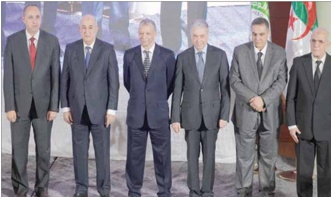
مرشحون للرئاسة الجزائرية في لقاء مع الصحافة في العاصمة أمس