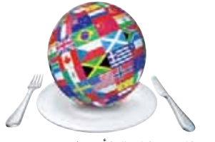
لندن: «الشرق الأوسط»