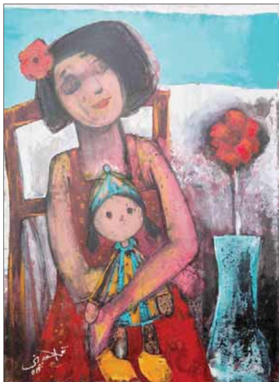
اللهو بالعباب صممتها أمهاتهم وجداتهم

والطفولة السعيدة، حيث اعتبر أن من يقضي سنواته الأولى وسط الحقول والطبيعة والبيئة الفولكلورية الثرية التي توجد في القرى المصرية إنما قد تدفق