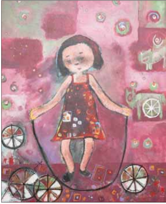
تعكس الأعمال شغف الأطفال في الماضي بممارسة ألعاب بسيطة