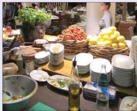
مدرسة الطهي في نوفيوكوف فرصة لتعلم أسرار الطبخ على أيدي أمم الطهاة

مدرسة نوفيوكوف للطهي فرصة شهيرة لتعلم أسرار المهنة