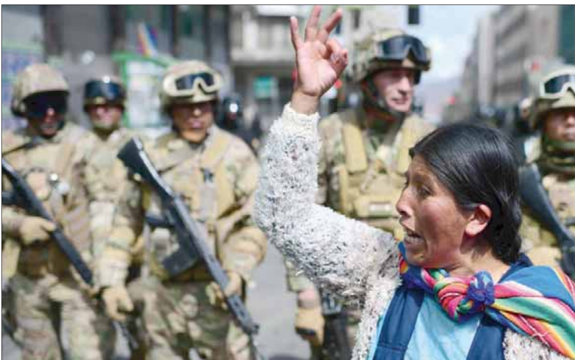
وقعت المواجهات الأخيرة خلال الاحتجاجات الحاشدة في مناطق زراعة «الكوكا» التي تعد المعقل الشعبي للرئيس المستقيل موراليس