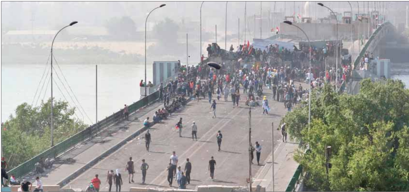
محتجون يتقدمون على جسر السنك في بغداد بعد انسحاب القوات الأمنية أمس

انتهت أمس، ما يمكن تسميتها «معركة السيطرة على الجسور» التي تدور رحاها منذ نحو أسبوع بين القوات الأمنية العراقية والمتظاهرين في بغداد، لصالح المحتجين الذين سيطروا على جسري «السنك» و«الأحرار» المرتبطين بساحتى «الخلاني» و«السنك» في جانب الرصافة، وإبعاد القوات الأمنية إلى مدخل الجسرين من جهة الكرخ.