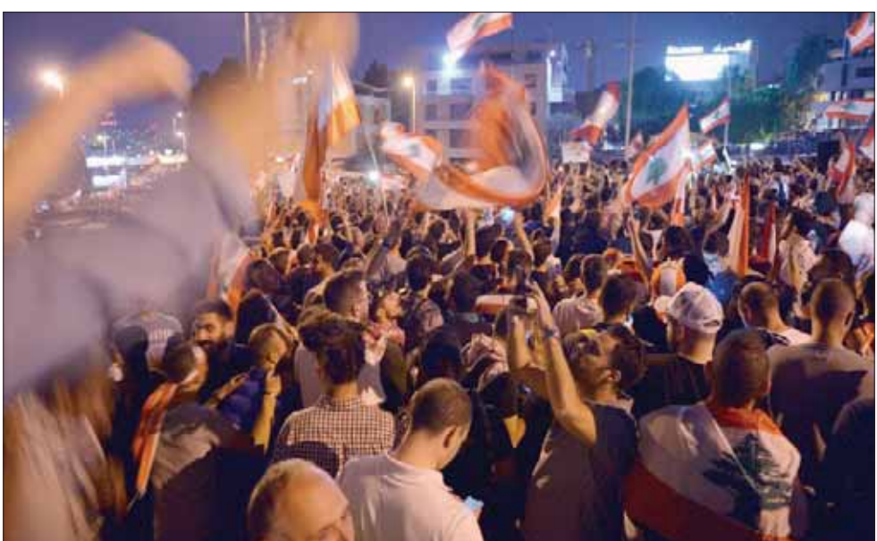
مظاهرة على الطريق إلى القصر الجمهوري في جبعا أثارت احتجاج مؤيدي الرئيس ميشال عون

يتابع مناصرو «الثنائي الشيعي» أي حركة «أمل» و«حزب الله» كما «التيار الوطني الحر» باستثناء عارم من مشاهد قطع الطرقات والتصريحات التي يطلقها المتظاهرون المشاركون بما عُرف بـ«انتفاضة 17 أكتوبر»، منذ نحو شهر على شاشات التلفزة المحلية. ويشعر هؤلاء بالاستفزاز كل مرة يُقدم المشاركون بالحراك على شتم زعمائهم ورفع لافتات تهتهمهم بالسرقة والفساد. إلا أن سياسة ضبط النفس التي تتبناها كل الأحزاب السابق ذكرها تُضطر هذه الجماهير على حصر ساحة المواجهة بوسائل التواصل الاجتماعي بعدما كان لمناصري «التيار الوطني الحر» القدرة على الرد على الحملات التي يتعرض لها رئيس «التيار» جبران باسيل ورئيس الجمهورية العماد ميشال عون خلال مظاهرة شارك فيها المئات مطلع الشهر الجاري دعماً للآخر. وتُجمع قيادات «الثنائي الشيعي»