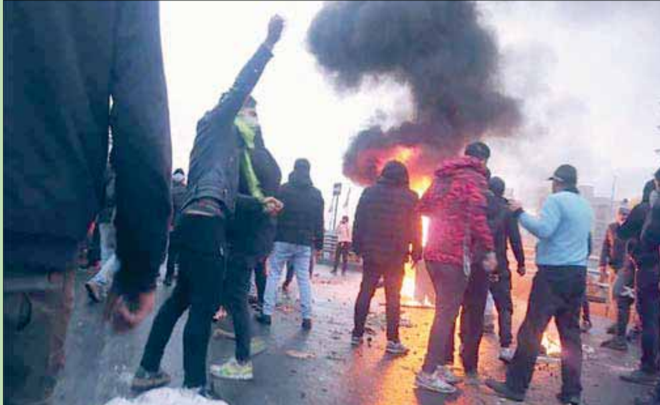
جانب من الاحتجاجات ضد قرار الحكومة الإيرانية بزيادة أسعار البنزين في طهران أمس