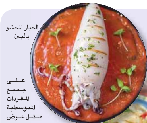
الحبار المشوي بالخبز

من ناحية أخرى، يربط البعض بين الوجبات الشهية التي يتعين تجربتها ولو مرة واحدة وبين الطهاة الذين يعدونها. ولذلك، يظل حلم