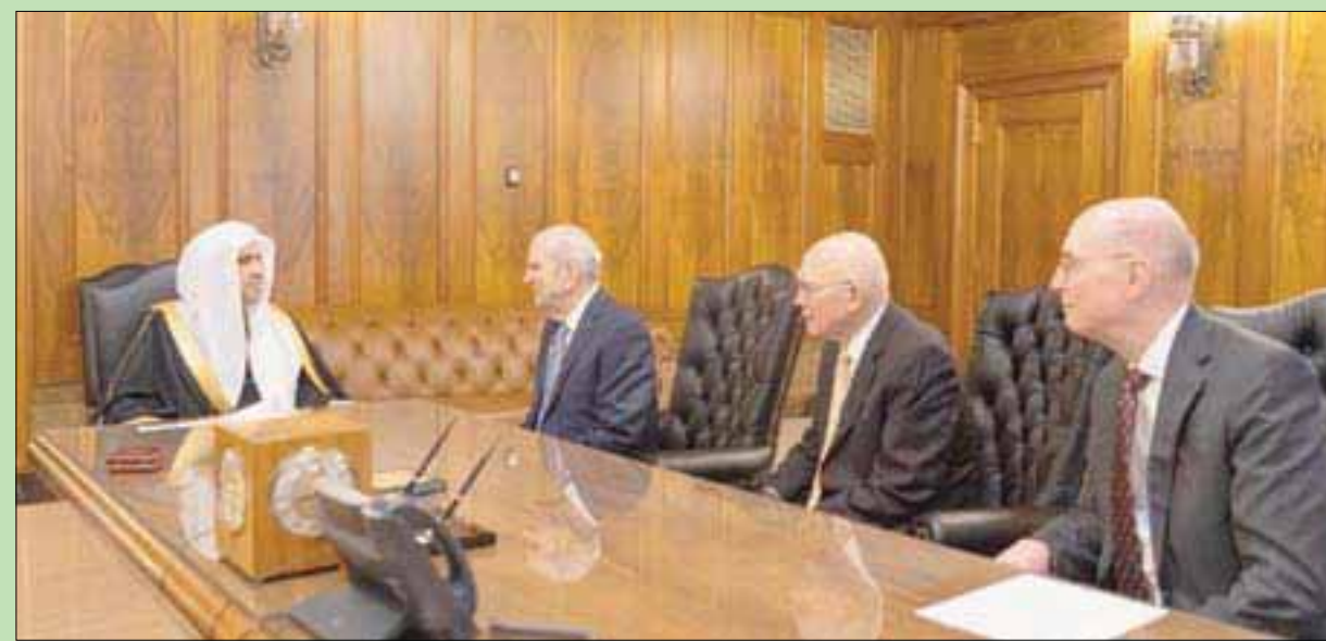
جانب من لقاء الشيخ العيسى مع رئيس طائفة المورمن نيلسون ومساعديه في ولاية يوتا الأميركية

من جانبه، أكد الأمين العام للرابطة العالم الإسلامي في محاضرته، أن الرابطة حملت رسالة بناء الجسور وإزالة