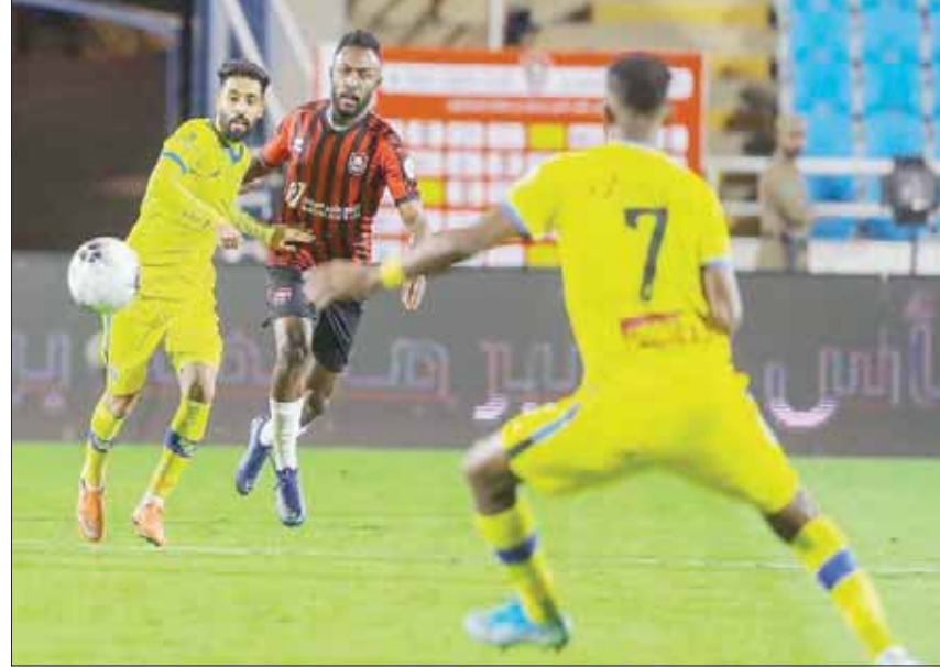
من منافسات دوري المحترفين السعودي (الشرق الأوسط)

منحوبات، أعيد نظامها إلى صيغته السابقة من مجموعتين، بعد تأكيد المشاركة الكاملة للمنتخب الخليجية، وأجريت قرعة جديدة وزعت المنتخبات بموجبها على مجموعة أولى تضم قطر والإمارات واليمن والعراق، وثانية تضم سلطنة عمان حاملة اللقب مع السعودية والكويت والبحرين. وستقام مباراة الافتتاح بين قطر والعراق على ملعب خليفة الدولية، فيما ستقام مباراة الإمارات واليمن على ملعب الدحيل، فيما تلحق سلطنة عمان نظيرتها البحرين على ملعب الدحيل، بينما تستهل السعودية مشوارها الخليجية بدربي خليجي عريق وتاريخي أمام الكويت، وسيقام على ملعب الدحيل. وتواجه الإمارات نظيرها المنتخب العراقي في ثاني الجولات، فيما يلحق المنتخب اليمني نظيره القطري، أما الكويت فحوض ثاني مبارياتها أمام سلطنة عمان، بينما ستكون البحرين في مواجهة السعودية، على أن تحوّل قطر ثالث مبارياتها أمام الإمارات، بينما تلعب الكويت أمام البحرين، أما اليمن فتلاقي العراق، وتختتم السعودية مواجهات دور المجموعتين في 2 ديسمبر (كانون الأول) المقبل بمواجهة سلطنة عمان، ثم تبدأ بعد ذلك سلسلة المواجهات الودية في الشهر المقبل، لتختتم البطولة في الثامن من ديسمبر (كانون الأول) المقبل.