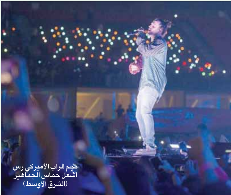
نجم الراقص الأمريكي اشعل حماس الجماهير (الشرق الأوسط)