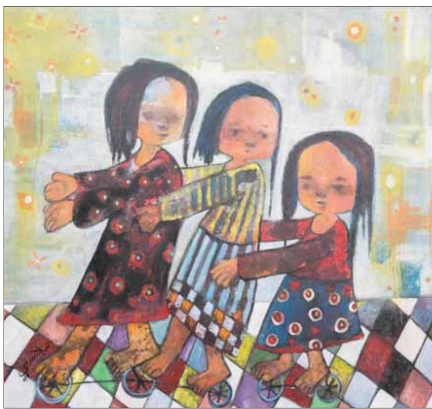
لحظات من اللهو والمرح