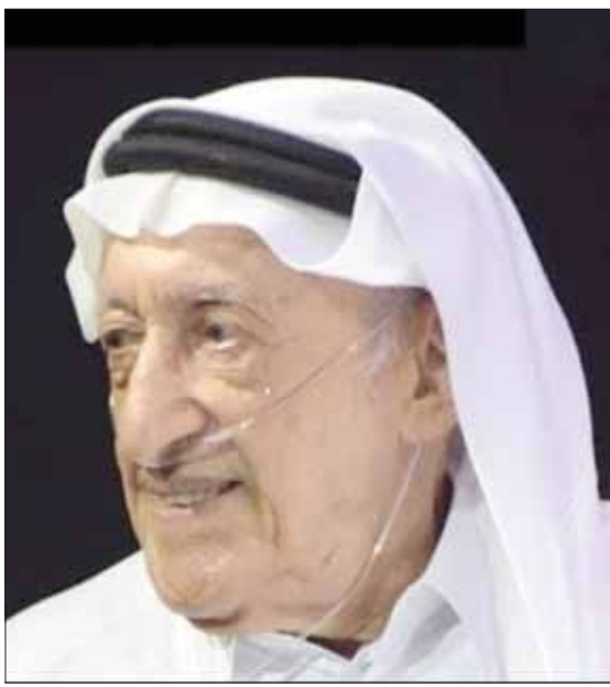
محمد العلي في ندوة عن الاعتراب

تساعده على التنفس دون عناء، لكي يحذتهم عن «الاعتراب». يمثل الشاعر محمد العلي رمزاً للحداثة السعودية، وخاصة في تجربتها الشعرية، غرس حضوره في المشهد الثقافي والفكري، وأدأ للتجديد، والخروج عن السائد، ومجازاً إلى بناء «العقل النقدي» والعقلانية، ومبتدئاً للأشكال الشعرية الجديدة، كما أنه شاعر متفعل مع عصره، يتمتع بعمق ثقافي وفلسفي، ورغم قلة شعره، فإن كل قصيدة تصحّج بالمعاني والوجدان والانفعال. شاعر صنع الدهشة في كل نض كتبه، وفي كل مقفلة فحرفها في قصائده: «العبد والخليج»، «لا ماء في الماء»، و«الأساطير»، و«الوَجع»، وكلها نصوص مثقلة بالمعنى كما هي مثقلة بالهيم الإنساني الكبير الذي يحمله محمد العلي.