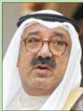
الشيخ ناصر صباح الصباح وزير الدفاع

ولأصرتي وطعن في ذمّي المالية دون دليل أو برهان». وأكد أن صندوق الجيش وحسابات الجيش قد تم إنشاؤها منذ تأسيس الجيش الكويتي، ولها أغراض تخصص بالامن الوطني للبلاد، وقد أشرف عليها وزراء الدفاع المتوالون منذ تأسيسها، مشيراً إلى أنه منذ توليه حقيبة وزارة الدفاع لم يتغير الأهداف والأغراض التي أُنشئ لها الصندوق والحسابات ولم تخرج عن النشاط المنشأ من أجله.