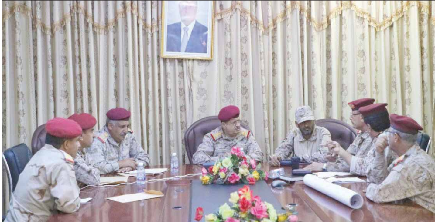
وزير الدفاع اليمني لدى اجتماعه مع قيادات عسكرية في مأرب أمس