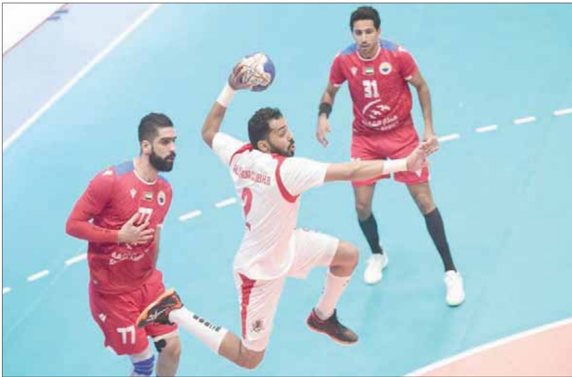
فريق الوحدة في مباراته الأخيرة أمام الشارقة الإماراتي