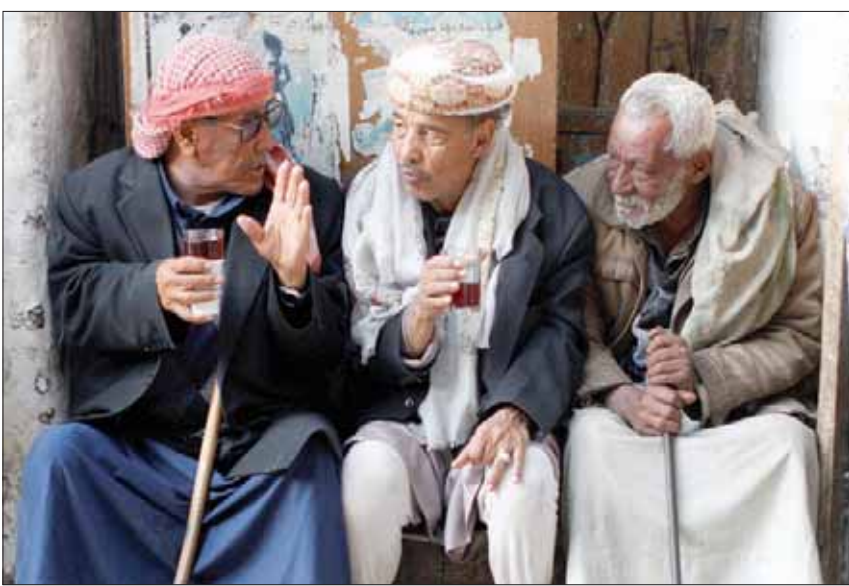
يمنيون يتحدثون في مقهى وسط المدينة القديمة بصنعاء

وإذا كانت فاعليات حقوقية محلية، مسنودة بمؤازرة منظمات دولية أبرزها «يونيسيف»، نجحت في التوصل فعلياً إلى الضغط باتجاه إيقاف تنفيذ ما يزيد على 20 حكماً قضائياً بالإعدام، ضد باركتاب القتل وهم في سن الحدث، في السجون الاحتياطية والمركزية في صنعاء وباب الحديدة وعمران وصعدة وحجة، وريمة ودمار. وكشفت دراسة نفذتها اللجنة الفنية لتعزيز عدالة الأطفال بالتعاون مع منظمة الأمم المتحدة للامومة والطفولة (يونيسيف) أو الجانحين منهم خصوصاً.