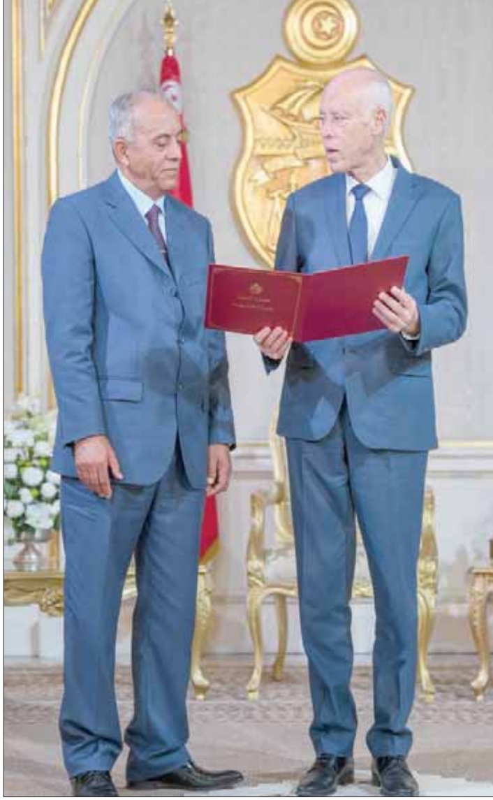
الرئيس قيس سعيد مستقبلاً رئيس الحكومة المكلف الحبيب الجملي في قصر قرطاج أمس

وفي حال الاتفاق على توزيع الحقائق الوزارية بين مختلف الأحزاب المنضمة للائتلاف الحاكم الذي تتزعمه «النهضة»، فإن الحكومة المقبلة ستشكل ثفة البرلمان بغالبية مطلقة لكنها لن ترقى إلى مستوى ما حصلت عليه حكومات سابقة من دعم بلغ أكثر من 170 صوتاً، وستكون، في المقابل، في مواجهة معارضة قوية داخل البرلمان.