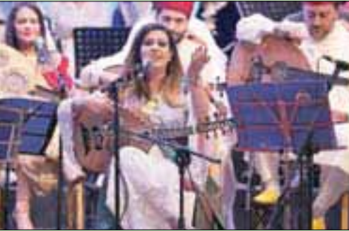
جانب من الحفل الموسيقي بمناسبة الذكرى الـ 60 لتأسيس وكالة الأنباء المغربية (مأب)