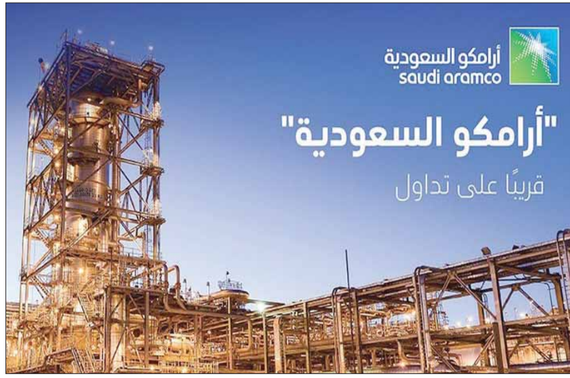
ملصقات دعائية تكثف الحديث عن قرب إدراج سهم «أرامكو»

الرياض، «الشرق الأوسط» تتوقع مؤسسة «ستاندرد أند بورز» للتصنيفات الائتمانية - أحد أبرز المنظمات الدولية في تقييم الوضع المالي للدول والشركات - أن يساهم سهم شركة الزيت العربية السعودية «أرامكو» بعد الطرح العام والإدراج، في رفع نمو الاقتصاد المحلي السعودي، في إطار الاستفادة من حصيلة وأوضحت «ستاندرد أند بورز» - أسس، أن إدراج «أرامكو» السعودية الوشيك في سوق الأسهم المحلية، قد يساعد على تقوية صافي مركز أصول الحكومة، مشيرة إلى أن التقييمات التي ستصدرها ستحسب نمو الاقتصاد السعودي بمعدل نمو الاقتصاد العالمي.