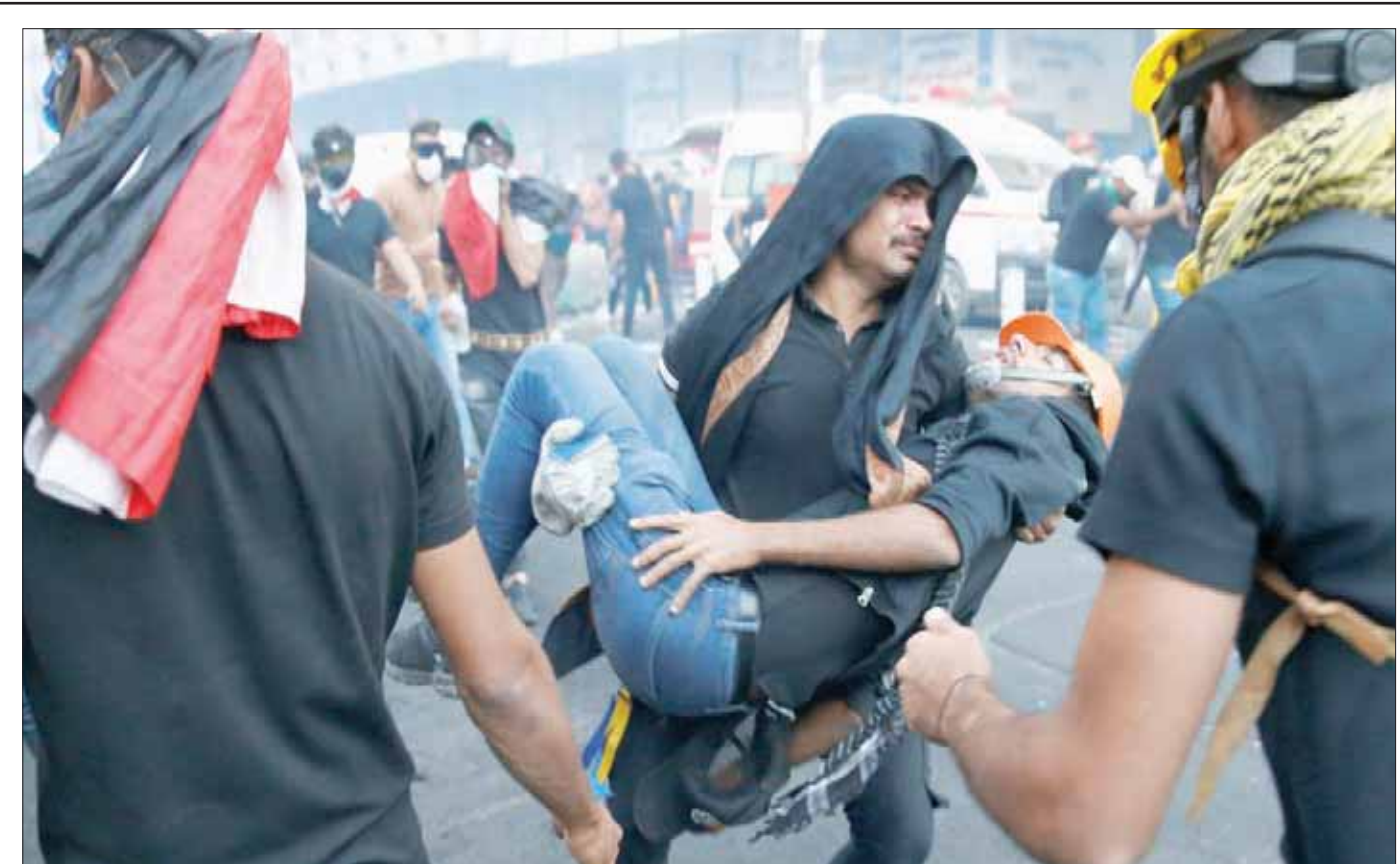
متظاهر يحمل رفيقاً له أصيب في مواجهات مع قوات الأمن وسط بغداد أمس