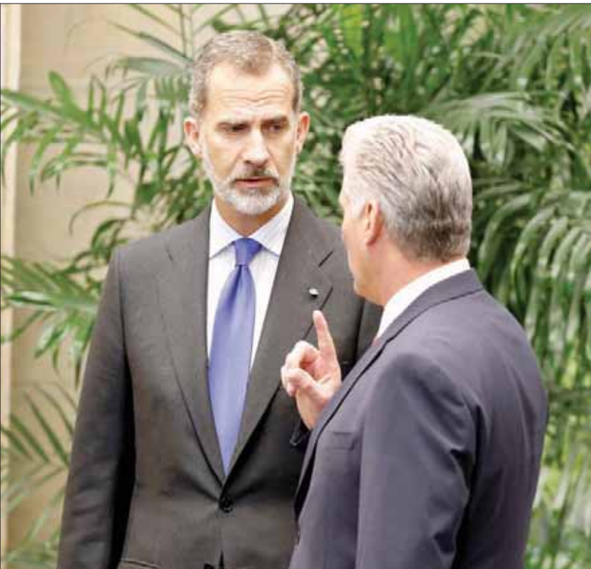
العاقل الإسباني مع الرئيس الكوبي ميغيل دياز كانيل في هافانا

البلاد في التقدم». وقال دياز كانيل: «كل أسبوع يصدر إجراء جديد»، بينما أوصت الحكومة الكوبية أكثر من 180 قراراً أميركياً منذ يونيو (حزيران) 2017، وبين هذه القرارات تفعيل القانون الأميركي هيلمس بورتون الذي يهدد بملاحقة الشركات الأجنبية التي تعمل في الجزيرة. ومنذ ذلك الحين يستهدف القضاء مجموعات كبيرة مثل «أميركان إيرلاينز» و«كارنيرفال» و«أمازون».