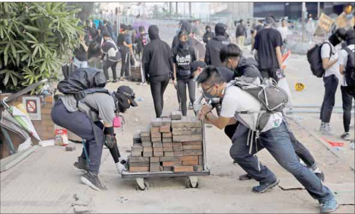
محتجون ينقلون الطوب استعداداً لمواجهات مع قوات الأمن في هونغ كونغ

سفارة الصين في المملكة المتحدة بقوة الهجوم الذي تعرضت له الوزيرة، وعُثرت عن استيائها الشديد تجاه تلك الواقعة. وحدثت السفارة الصينية الشرطة البريطانية على إجراء تحقيق شامل في الواقعة، وتشديد الإجراءات الأمنية لموظفيها ومنظماتها في المملكة المتحدة. وطوقت تشينغ، التي لا تحظى بشعبية كبيرة، من قبل نحو 10 متظاهرين ملثمين، فيما كانت تستعد لحضور حفل مساء الخميس في لندن. وصوّب المظاهرون أضواء الكشافات باتجاهها، فيما كانوا يصرخون في وجهها: «قاتلة»، مرددين شعارات حركة الاحتجاج المدافعة