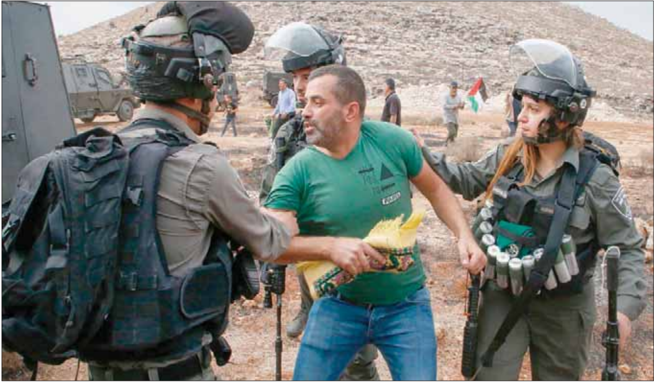
جانب من احتجاجات أمس قرب مدينة الخليل في الضفة الغربية

الإعلام الإسرائيلية أن الجيش الإسرائيلي وجهز الأمن العام (الشباباك) توجهوا إلى المستوى السياسي، إلى استغلال اتفاق وقف إطلاق النار بين إسرائيل والجهاد الإسلامي، إلى «استغلال جولة القتال الأخيرة والناجحة، نسبيا، من أجل دفع تهديته مقابل حماس بوساطة مصرية». وقالت صحيفة «هارتس» إن «مسؤولين أمنيين إسرائيليين أوصوا أمام المستوى السياسي بمنح منافع اقتصادية ومدنية لحماس، التي لم تشارك في جولة القتال، من أجل صد انتقادات تجاهها في أوساط الجمهور الفلسطيني». ونقلت الصحيفة عن مصادر شاركت في مداوات أمنية، في الأيام الأخيرة، قولها إن وزير الأمن الإسرائيلي، نفتالي بينيت، ومع أنه ينتمي إلى اليمين المتطرف: «يتعامل مع الاقتراح بشكل إيجابي». ودعا مسؤولون أمنيون إلى التعامل مع هذا الموضوع بحذر «من أجل عدم تصوير حماس كمتعاون مع إسرائيل انطلاقا من دوافع انتهازية». وأعلن وزير الخارجية، يسرائيل كاتس، أنه «في بعض الحالات تجد إسرائيل نفسها في لقاء مصالح مع حماس». ومع ذلك فقد لفتت «هارتس» إلى أن القادة الإسرائيليين فوجئوا من