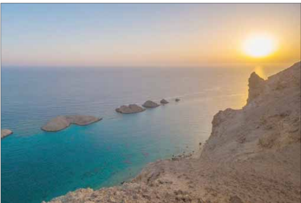
السواحل والشواطئ فرص ماثلة في مشروع نيوم العملاق

واستعرض الوفد الأردني مزايا الاستثمار في عدد من المناطق الأردنية، منها منطقة العقبة، وصدوق استثمار الضمان الاجتماعي الأردني، وفرص الاستثمار في أفضل عشر شركات أردنية وفرص الاستثمار في شركات قابلة للإدراج، والاستثمار في صكوك التمويل الإسلامي. وتضمنت النقاشات عرض المشاريع الصناعية والزراعية والدوائية والسياحية، فيما تحدث رجال أعمال سعوديون مستثمرين في الأردن عن بعض العوائق اللوجيستية أو التنظيمية التي واجهوها في الأردن.