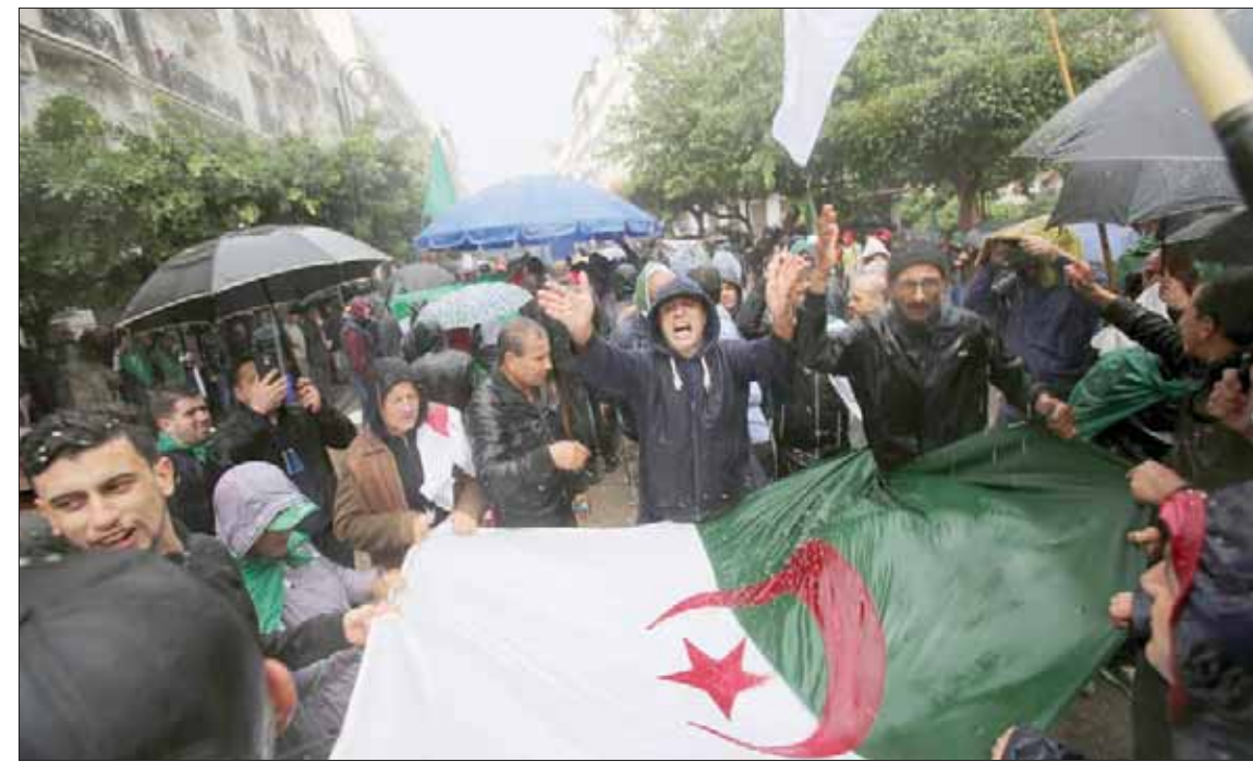
مشاركين في الاحتجاجات التي شهدتها العاصمة الجزائرية أمس

من جهتها، قالت منظمة «هيومن رايتس ووتش» الحقوقية، في تقرير نشرته أمس، إن السلطات الجزائرية «اعتقلت العشرات من نشطاء الحراك المؤيد للديمقراطية منذ سبتمبر (أيلول) 2019، وما زال الكثيرون محتجزين بتهم غامضة، مثل المساس بسلامة وحدة الوطن وإضعاف الروح المعنوية للجيش». واعتبرت أن «السلطات الإفراج فوراً عن النشطاء السلميين، دون قيد أو شرط، واحترام حقوق حرية التعبير والتجمع لجمع ليبيا الجزائريين». وذكرت سارة ليا ويتسن، المديرة التنفيذية في