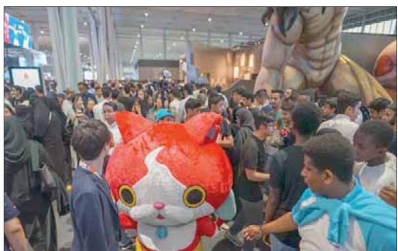
في موسم الرياض التقى محبو الشخصيات الخارقة وأبطال «الأنيمي» الياباني

المعجبين الذين ارتدوا أزياء الأبطال المفضلين لهم، وتهاوتوا على شراء مقتنيات تمثل هذه الشخصيات. ويضم معرض «ستان انيمي» أجنحة وركائز كثيرة، تعرض دمي وصورا ومركبات وطعما للذكري، إضافة إلى عروض تذكيرية بأشكال عشرات الشخصيات التي تعد أبداً للأطفال والمثابرين لهذه النوع من الترفيه، الذي شكل مسلسلات وأفلاماً شهيرة وصلت في انتشارها إلى مختلف دول العالم.