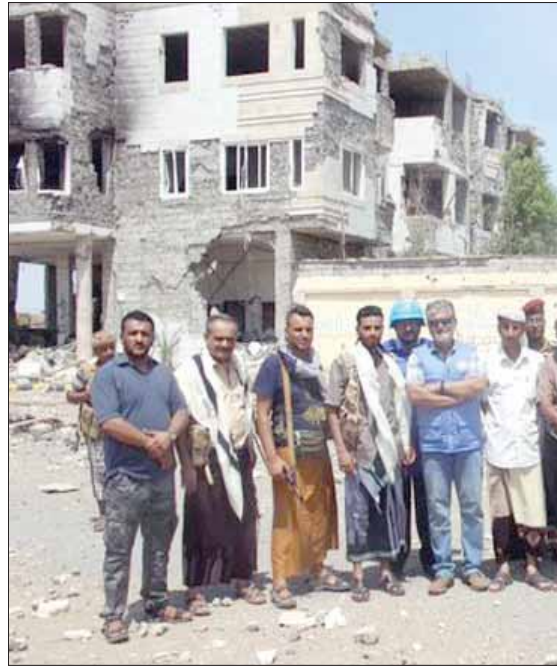
الجنرال أبهاجت غوها لدى وقوفه وفريقه على إحدى نقاط المراقبة المشتركة بين الحكومة والحوثيين في الحديدية أكتوبر الماضي (الشرق الأوسط)

ويعد أقل من شهر، سيبلغ عمر اتفاق الحديدية عاماً كاملاً، من دون أن يحقق تلك النجاحات التي يطمح لها، لكن المبعوث الأممي إلى اليمن قال في حديث قبل أسبوعين مع «الشرق الأوسط»، إنه يرى بعض البؤار الإيجابية، في إشارة إلى استحداث غرفة مراقبة مشتركة (بين الحكومة والحوثيين) مقرها سفينة