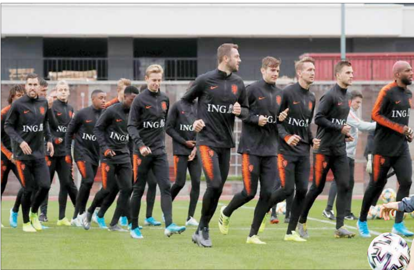
هولندا تحتاج إلى نقطة وحيدة لبلوغ النهائيات

حسمت بطاقتا التأهل من هذه المجموعة رسمياً قبل مباريات الجولتين الأخيرتين حيث حجز منتخب بلجيكا وروسيا مقعديهما في النهائيات. ويتصدر المنتخب البلجيكي المجموعة برصيد 24 نقطة من الفوز في جميع المباريات الثماني التي خاضها في المجموعة حتى الآن، بينما يحتل المنتخب الروسي المركز الثاني برصيد 21 نقطة. وتأتي منتخبات قبرص (عشر نقاط) واسكتلندا (سبع نقاط) وكازاخستان (سبع نقاط) وسان مارينو (بلا رصيد) في المراكز التالية بالمجموعة التي تشهد اليوم مباريات روسيا مع بلجيكا، وقبرص مع اسكتلندا، وسان مارينو مع كازاخستان، بينما تختتم منافساتها يوم الثلاثاء المقبل بمباريات سان مارينو مع روسيا، واسكتلندا مع كازاخستان، ولاتفيا والنمسا.