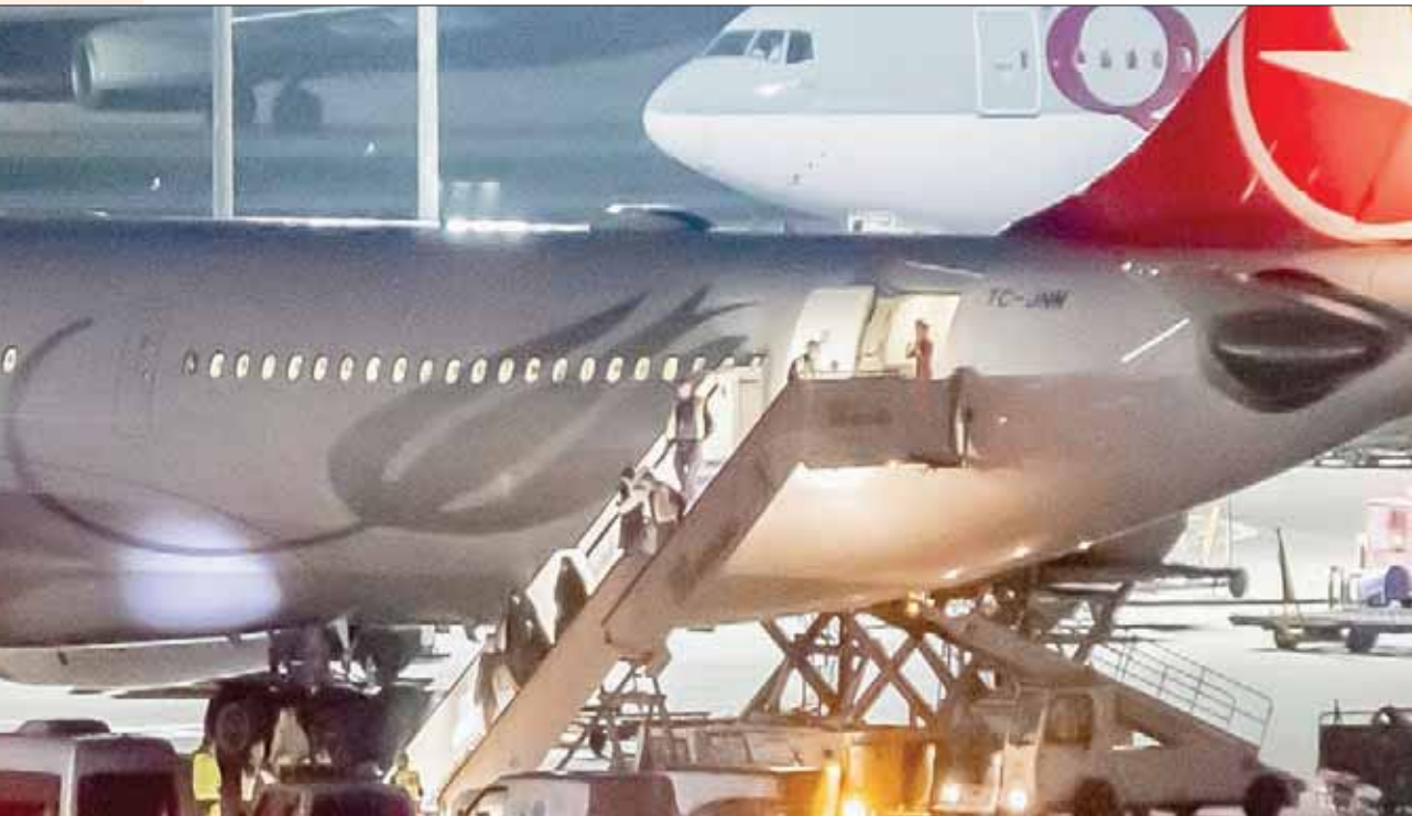
7 متهمين بالانتماء لـ«داعش» يغادرون طائرة تابعة للخطوط التركية لدى وصولهم إلى مطار تيجل في برلين قبل أن تحتجزهم الشرطة الألمانية أمس

وبدأت السلطات التركية ترحيل مقاتلي «داعش» الموقوفين لديها، الذين قال الرئيس التركي رجب طيب أردوغان إن عددهم 1150 عنصراً، إضافة إلى 287 عنصراً القبيض عليهم، شمال شرقي سوريا، خلال عملية نزع السلاح العسكرية التركية في أكتوبر (تشرين الأول) الماضي، إلى بلاده، يوم الاثنين. ورحلت تركيا، أول من أمس 7 إرهابيين ألمان ينتمون إلى «داعش» لبرلين، وآخر بريطاني إلى لندن. وقالت وسائل إعلام ألمانية إن السلطات الألمانية تسلمت الإرهابيين السبعة عقب وصول طائرة تقلهم إلى برلين، مضيعة أن الإرهابيين المرشحين هم المان من أصول عراقية، وأن أماكن إقامتهم في مدينة هيلدسهايم التابعة لولاية ساكسونيا السفلى. ولم ينضج بعد ما إذا كان المرءون سيحلون إلى المحكمة أم لا. في السياق ذاته، أكد وزير الخارجية التركي مولود جاويش أوغلو أن القضاء على الإرهاب يستوجب توحيد الجهود وعدم التمييز بين المنظمات الإرهابية، معتبراً أنه «لا يمكن القضاء