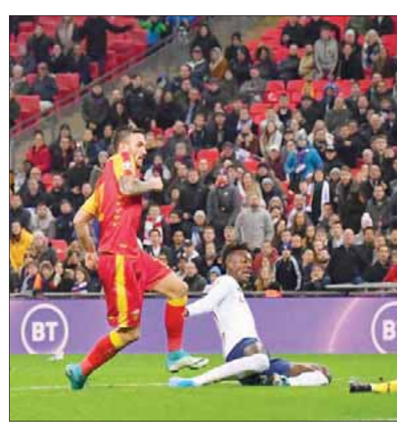
الهدف الدولي الأول لأبراهام تامي مع المنتخب الإنجليزي

سترلينغ لم تواجه إنجلترا أي مشكلة في ظل مشاركة جيدون سانكشو وصارغوس راشفورد بجوار كين. وافتتح الكيس أوكسليد تشامبرلين التسجيل لإنجلترا، التي كانت تخوض المباراة الدولية رقم الف، في الدقيقة 11 قبل أن يضاعف كين الغلة بعدها بثماني دقائق. وجعل كين النتيجة 3 - صفر بضربة رأس أخرى في الدقيقة 24، وسجل ماركوس راشفورد الهدف الرابع لإنجلترا في رمى مونتغرو متذلل المجموعة دون أي انحصار. واختتم كين ثلاثيته في الدقيقة 37 بتسديدة منخفضة رائعة لتتقدم إنجلترا 5 - صفر قبل الاستراحة. وقال كين الذي تقدم إلى المركز الخامس في قائمة هدافي إنجلترا: «تعرضنا لهزيمة واحدة في المجموعة ورد فعلنا كان جيداً. أنجزنا العمل وقدمنا عرضاً رائعاً في المباراة رقم 1000 وتسجيل خمسة أهداف في الشوط الأول فاعتقد أننا فعلنا ذلك». وألقى الحكم هدفاً ليسون ماونت بعد الاستراحة لكن الكسندر سوفرانتش سجل هدفاً بالخطأ في مرماه لتصبح النتيجة 6 - صفر. وسجل البديل تامي أبراهام أول أهدافه