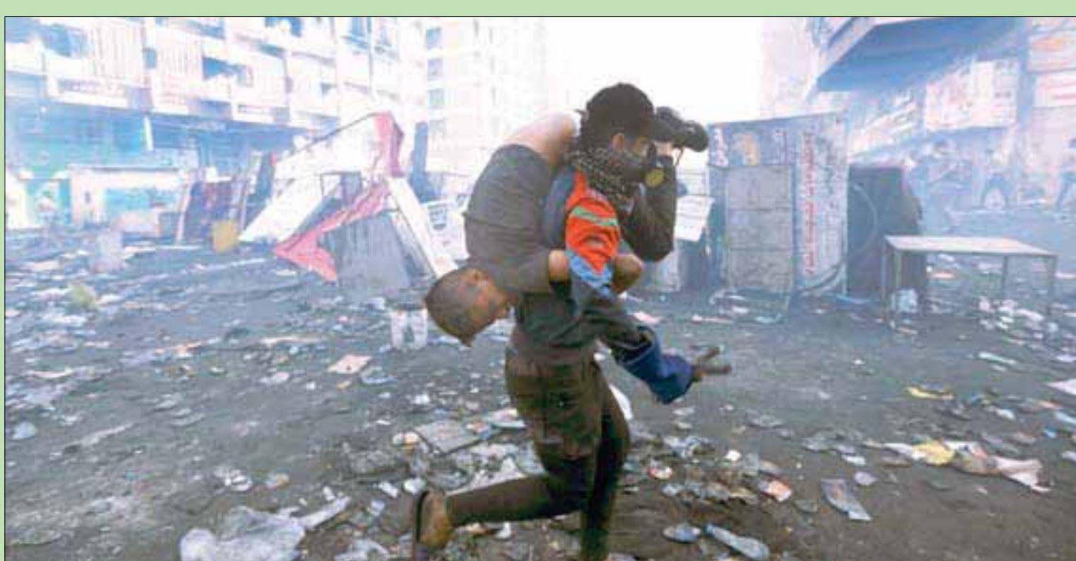
إجلاء أحد جرحى المواجهات بين المحتجين وقوات الأمن وسط بغداد أمس