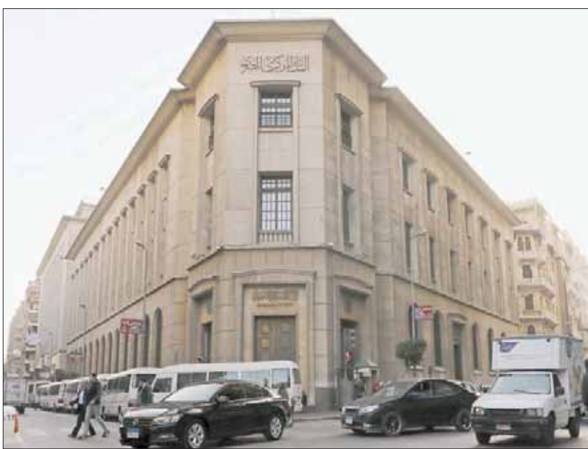
البنك المركزي المصري خفض الفائدة كما كان متوقفاً على نطاق واسع

انتهاء أثر صدمات العرض المؤقتة لأسعار الخضراوات الطازجة في العام الماضي. ونظراً للتطورات المحلية والعالمية كافة، قررت لجنة السياسة النقدية خفض أسعار العائد الأساسية لدى البنك المركزي بواقع 100 نقطة أساس. ويتسق ذلك القرار مع تحقيق معدل التضخم المستهدف، البالغ 9 في المائة (بـ 3 في المائة) خلال الربع الرابع، واستقرار الأسعار على المدى المتوسط. كما يوفق خفض أسعار العائد الأساسية في اجتماع اليوم والاجتماعات السابقة للجنة الدعم المناسب للنشاط الاقتصادي في الوقت الحالي. وأكد المركزي أن اللجنة ستستمر في متابعة التطورات الاقتصادية كافة، ولن تتردد في تعديل سياستها للحفاظ على الاستقرار النقدي.