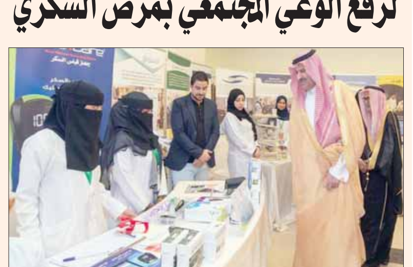
الأمير فيصل بن سلمان خلال اطلاعه على المعرض المصاحب للمؤتمر العلمي للسكري الذي دشنته بالمدينة المنورة