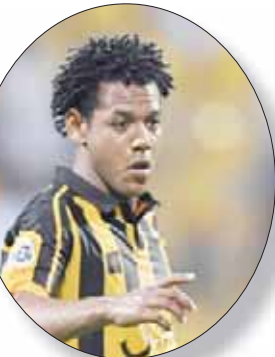
رومارينهو (الشرق الأوسط)

المنطقة الشرقية الثلاثة المقبل لإقامة معسكر إعدادي يسبق مواجهته أمام الاتفاق ضمن منافسات الجولة العاشرة. ومن جانبه وصل البرازيلي جوناو دي سوزا برنامجا علاجيا بعد الإصابة التي تعرض لها خلال مواجهة الفريق الماضية أمام الرياض.