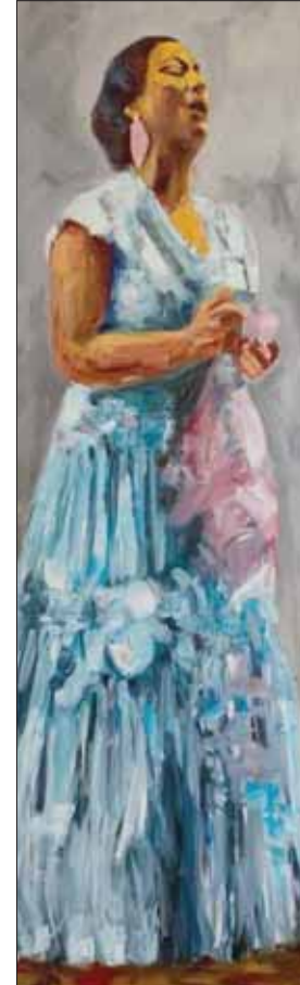
لوحة من المعرض

المعرض يقدم لنا لوحات من وحي أغنيات أم كلثوم استعداد الفنان كثيرا من الفيديوها التي تضمنت حفلاتها وكما يوضح «كنت أتيت شريط الفيديو لساعات على إحدى حفلاتها لاستشرف روحها في اللوحة خاصة أنني لا أقدم صورة فوتوغرافية لها إنما هي لوحة في عمل فني يتضمن رؤيتي وإحساسي وفي كل صورة ثمة وجه مختلف