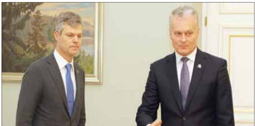
رئيس ليتوانيا جيتاناس ناوسيدا (يمين) مع رئيس الاستخبارات دارويس جاونيسكيكس (أ.ف.ب)

وفي فبراير (شباط) الماضي، قامت إستونيا وروسيا بعملية تبادل على الحدود بينهما لرجلين محكومين بالسجن بتهمة تجسس. وشملت عملية التبادل في مركز كوديكولا الحدودي في جنوب شرقي أوكرانيا رجل الأعمال الإستوني رافيو سوسي والروسي أرتيوم زينتشينكو. وفي 2015 أفرجت روسيا عن الضابط الإستوني إيستو كوفرفي عملية تبادل على جسر وفق سيارابو أقرب إلى الحرب الباردة، مقابل مسؤول سابق في الاستخبارات الإستونية الكسبي برسين الذي حكم عليه بالسجن 16 عاماً بعد إدانته بالتجسس لصالح موسكو.