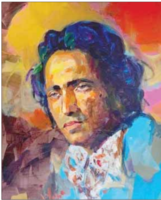
الموسيقيار بليغ حمدي

ويمثل معرض «صبا» للفنان حالة تحد يكشفها لنا قائلا: «نجاح المعرض سبب لي حالة من التحدي فداثما أسأل نفسي وماذا بعد، فكلما أقمت معرضا جديدا أشعر أنه يظل تجربة ومحاولات وانتقد أعمالتي بقسوة، ورغم أنني أرسم منذ نصف قرن فما زلت أقف على شاطئه، فالفن مجال ثرى وضخم وأرى أن النقد الذاتي هو الذي يدفع الفنان لتطوير نفسه».