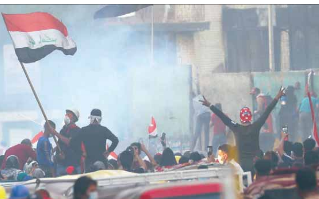
مظاهرة حاشدة ضد الحكومة في بغداد أمس