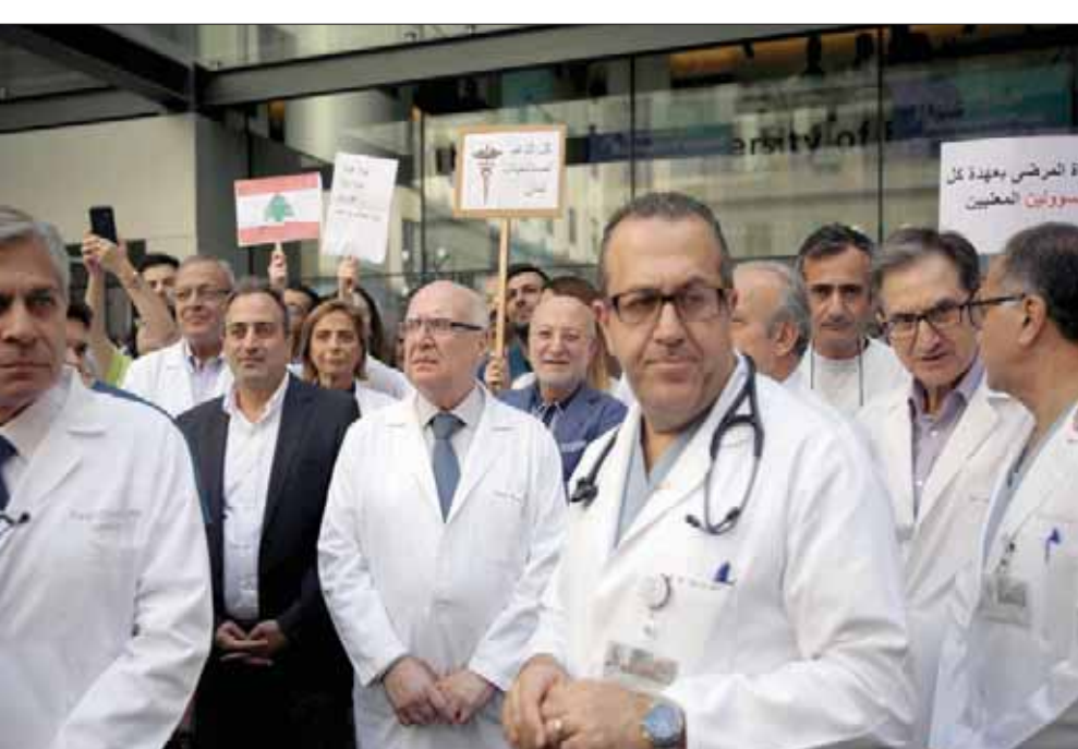
من الوقفة الاحتجاجية لأطباء، في مستشفى الجامعة الأميركية في بيروت

بيروت، «الشرق الأوسط» في اليوم الثلاثين للاحتجاجات الشعبية في لبنان استمرت التحركات في مختلف المناطق وسجل كر وفر أكثر من منطقة بين المتظاهرين والقوى الأمنية وأعلن عن توقيف عدد من الناشطين خلال محاولة الجيش فتح الطرقات، ليعود الأخير ويؤكد أن توقيفهم جاء على خلفية تعرضهم لعناصر الجيش. أتى ذلك في وقت بدأت دعايات الأزمة الاقتصادية تسع لتخطل مختلف القطاعات وكان آخرها المستشفيات التي أطلقت صرخة أمس بسبب نقص الأدوية والمستلزمات الطبية عبر تنفيذها إضراباً تحذيرياً. من جهتها، أكدت وزارة المال في بيان لها، أن «جميع مستشفيات المستشفيات الخاصة والحكومية المحولة من وزارة الصحة العامة قد تم صرفها بالكامل وتحويلها إلى حسابات المستشفيات في المصارف