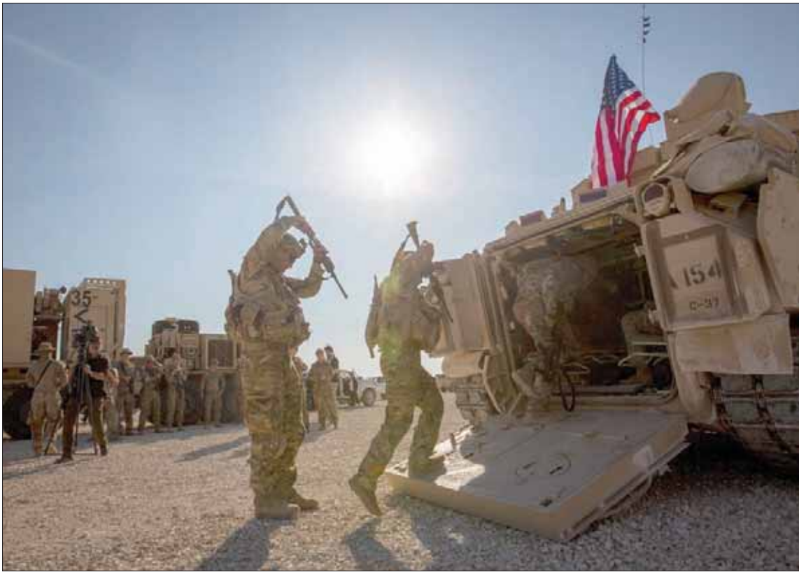
صورة وزعت أمس لعناصر من الجيش الأميركي في قاعدة شرق الفرات

نهاية المطاف»، مضيقاً أن التدخل الروسي المباشر في سبتمبر (أيلول) 2015 كان له تأثير أساسي في دفع جهود محاربة الإرهاب في هذا البلد، و«اعتقد أنه بوسع أي مراقب محايد أن يرى دور روسيا، أخذاً بعين الاعتبار كثافة العمليات القتالية ونتائجها». وزاد: «بعد بدء مشاركة روسيا الفعالة في محاربة الإرهاب في سوريا، شهد الوضع تطوراً مهماً». وأوضح بوتين أنه «منذ أن بدأت روسيا عمليات فعالة لدعم الحكومة الشرعية في دمشق، تم تحرير نحو 90 في المائة من الأراضي من أيدي الإرهابيين، وتم بسط سيطرة الحكومة السورية على تلك الأراضي». وأضاف أن روسيا «نفذت جميع المهام تقريباً التي حددتها لنفسها في سوريا». وتطرق إلى الوضع الحالي في شمال سوريا، مشيراً إلى أن الاتفاقات الروسية - التركية أكدت على ضرورة التعامل بسرعة وحزم مع أي انتهاكات. وقال إنه اتفق مع نظيره التركي رجب طيب أردوغان على هذه النقطة خلال المحادثات الهادئة التي جرت بينهما قبل أيام. وكان أردوغان اتهم في البداية روسيا والولايات المتحدة بعدم تنفيذ التزاماتها المتعلقة بسحب القوات الكردية من المنطقة الحدودية، ولوح باستئناف النشاط العسكري لإجبار الأكراد على الانسحاب، لكنه غير من لهجة بعد المحادثة الهادئة مع بوتين، وأعادت عن اتفاق مع الجانب الروسي على مواصلة تطبيق «اتفاق