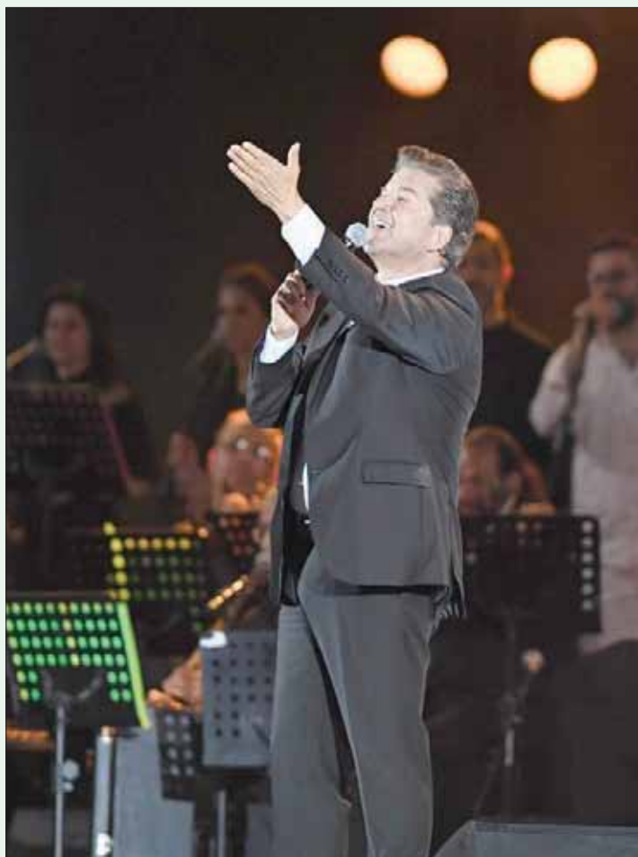
وليد توفيق قدم باقة من أجمل أغانيه القديمة والجديدة

مثل «أه يا ليل» و«أنا في الغرام» و«مشاعر» و«كثير خيري» و«كثير بنعشوق» و«يا بتفكر يا بتحس»، لتختتم فقرتها بجملة من الأغاني الكلاسيكية والرومانسية منها «أنت عمري» لأم كلثوم، و«ما بتفرحش»، و«على بالي»، والتي شارك الجمهور كذلك في غنائها.