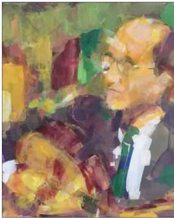
الموسيقيار محمد عبد الوهاب