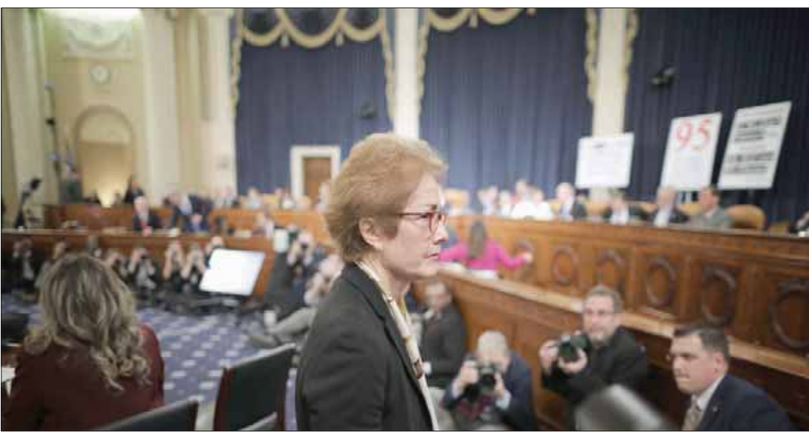
ماري يوفانوفيتش السفيرة الأميركية السابقة لدى أوكرانيا خلال استراحة من شهادتها أمام لجنة الاستخبارات

مطالباتهم بالكشف عن هوية المبلغ. وأتهم كبير الجمهوريين في اللجنة ديفن نونيز الديمقراطيون بالتخطيط لانقلاب على الرئيس الأميركي. وقرأ نونيز خلال جلسة الاستماع نص الاتصال الأول الذي أجراه الرئيس الأميركي بنظره الأوكراني فلاديمير زيلينسكي بعد فوز زيلينسكي بالانتخابات، وقد رفع البيت الأبيض السرية عن نص المكالمات تزامناً مع جلسة الاستماع. ولم يظهر نص المكالمات أي معلومات مفاجئة بل اقتصر على التهينة بفوز زيلينسكي وتعهدهم الرئيس الأميركي بارسال ممثلين عنه لحضور حفل التنصيب في أوكرانيا. وكان ترمب ذكر يوفانوفيتش خلال مكالمته مع زيلينسكي في الخامس والعشرين من شهر يوليو (تموز)، ووصفها بأنها مجرد خير سيئ، وقال إنها سوف تعاني من بعض الأمور، بحسب نص المكالمات، الأمر الذي