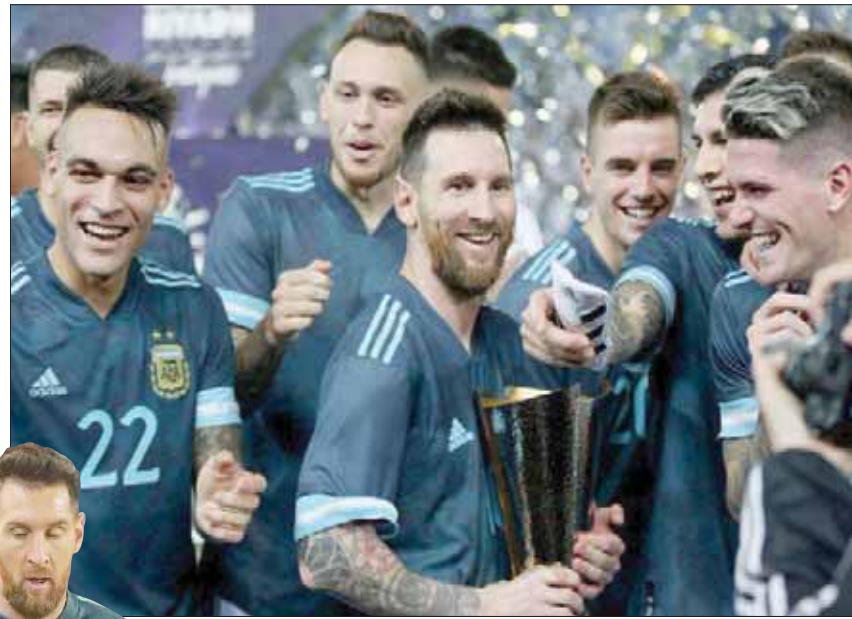
لاعبو الأرجنتين خلال التتويج بكأس السوبر كلاسيكو