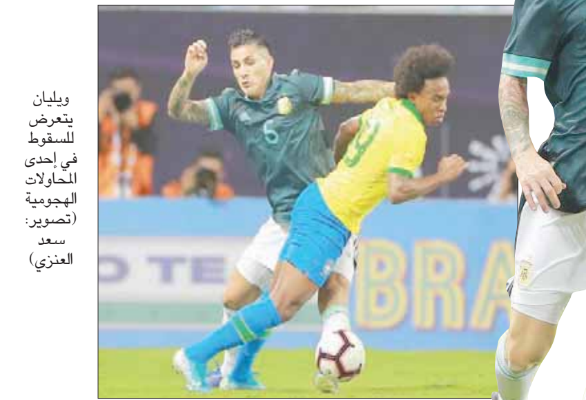
وليان يتعرض للسقوط في إحدى المحاولات الهجومية

حاول المنتخب البرازيلي الحفاظ على هدوئه وكثف تركيزه من جديد على الاستحواذ على الكرة والتحمل