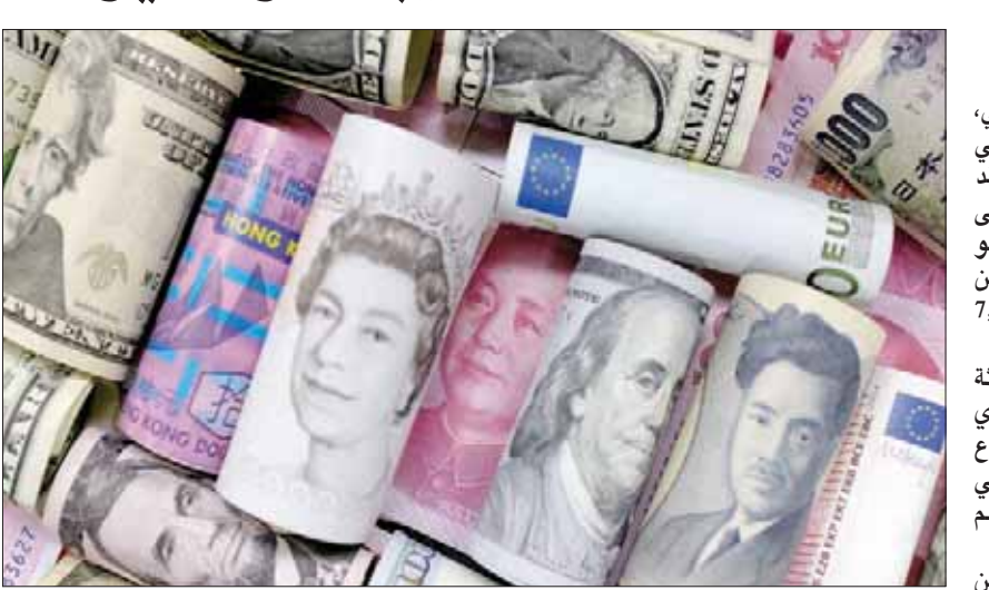
توقع معهد التمويل الدولي أن يقفز الدين العالمي إلى 255 تريليون دولار بنهاية العام الحالي

تقرب من الصفر، ويشير الإحصائيون المختصون في التوقعات الاقتصادية إلى أن الربع الأخير من 2019 سيشهد تراجعاً في نمو الناتج، وسالون عن قدرة ثالث اقتصاد في العالم على تجاوز ذلك لإظهار انتعاشه ما في 2020. ويرجع هؤلاء أن تقدم الحكومة مرة أخرى على إطلاق برامج تحفيزية وتيسيرية مالية ونقدية إضافية، ضخمة ربما، لإخراج الاقتصاد من براثن الانكماش المؤلم.