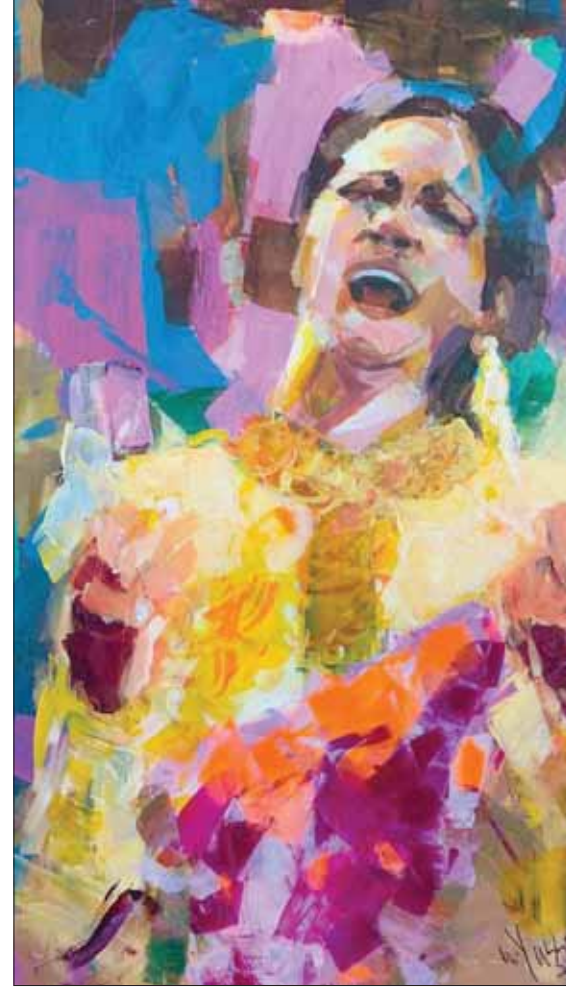
لوحة أم كلثوم في المعرض

في عمل فني يتضمن رؤيتي وإحساسي، وفي كل صورة ثمة وجه مختلف، فتارة نجددها وهي منسجمة في الغناء، وتارة وهي جالسة تتابع المقدمة الموسيقية، وأخرى وهي تمسك بمندليها الشهير ورابعة تكشف فساتينها المميزة التي تكمل شخصيتها على المسرح، واللوحات لا تنتهي لأغنية معينة بل من وحي كل حفلاتها الغنائية». ويؤكد: «لا أمل لإطلاق أسماء على لوحاتي