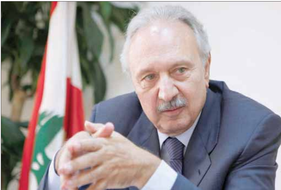
صورة من الأرشيف للوزير السابق محمد الصفيدي

يعني أن هناك صعوبة في تسويق اسم الصفيدي لتولي المنصب، إلا إذا قرر أن يدير ظهره للحركات الاحتجاجية الواسعة المعترضة على تسميته، وارتأى أن التمسك به يفتح الباب أمام تكثف رئيس الجمهورية مع استمرار تصاعد موجة «الحراك الشعبي» طالما أنه لم يعد في مقدوره اللجوء إلى قطع الطرقات؟ ورداً على موقف الرئيس الحريري قالت المصادر إن الأخير يهيمه عدم تمديد فترة تصريف الأعمال من قبل الحكومة المستقبليّة؛ لأن البلد لا يُدار في ظل التآزم الاقتصادي والمالي غير المسبوق بوجود حكومة لا تحكم، وأكدت أن الحريري أيّد تسمية الصفيدي لقطع الطريق على من يحضر له تهمة جاهزة بأنه يعيق تشكيل الحكومة، وقالت إنه سيدعمها وصولاً إلى منحها الثقة، لكن تيار «المستقبل»، لن يشارك فيها مباشرة أو بالواسطة.