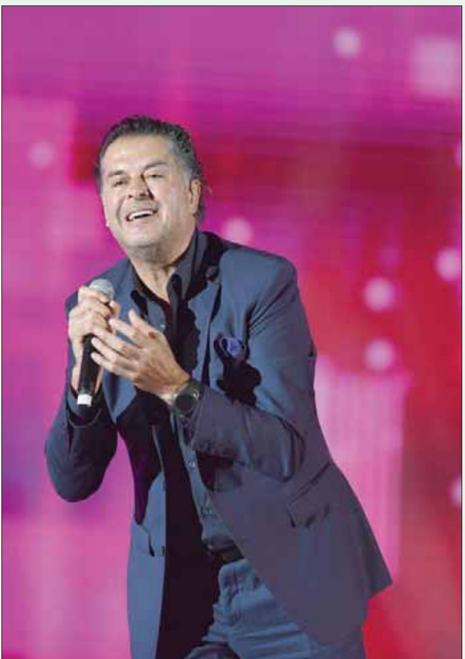
راغب علامة خطف الأنظار خلال وصلته الغنائية

مثل «أه يا ليل» و«أنا في الغرام» و«مشاعر» و«كثير خيري» و«كثير بنعشوق» و«يا بتفكر يا بتحس»، لتختتم فقرتها بجملة من الأغاني الكلاسيكية والرومانسية منها «أنت عمري» لأم كلثوم، و«ما بتفرحش»، و«على بالي»، والتي شارك الجمهور كذلك في غنائها.