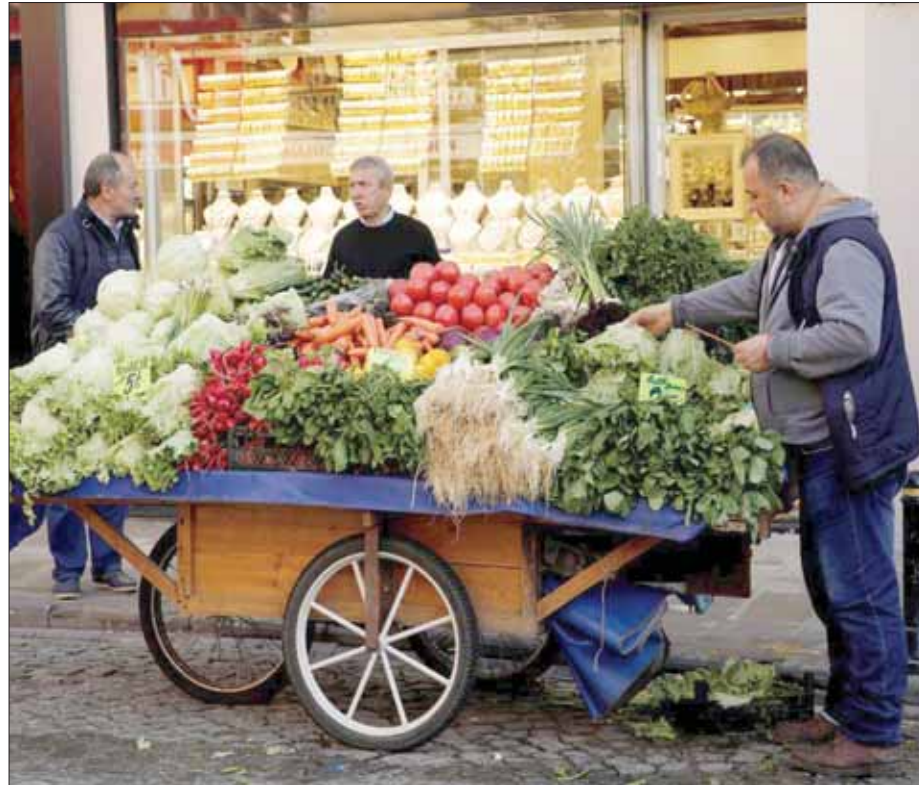
أدى تدهور الليرة التركية إلى صعود حاد في أسعار السلع الزراعية خلال الشهر الماضي

الانتحائي تعديل توقعاتها بشأن تركيا من «سليبي» إلى «مستقر»، وأكدت الوكالة تصنيفها عند مستوى «بي بي-»، قائلة إنها لا تتوقع تأثر المؤشرات الأساسية للائتمان بالعمليّة العسكرية التركية (نزع السلاح) في شمال شرقي سوريا. وقالت إن «تركيا واصلت تحقيق تقدم في إعادة توازن اقتصادها واستقراره، ما أدى إلى تقليص مخاطر الهبوط منذ مراجعتنا السابقة في يوليو (تموز)».