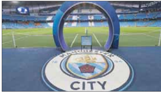
سيتي يواجه خطر الإبعاد عن دوري الأبطال

وردد فيها اسم النادي الإنجليزي وفريق باريس سان جيرمان، بطل فرنسا، المملوك من شركة قطر للاستثمارات الرياضية، وكشفت وجود تعمد في التحايل على قوانين اللعب المالي النظيف في الاتحاد الأوروبي. وأشارت التسريبات إلى أن النادي الإنجليزي سمح لأطراف راعية له بسخ أموال نقدًا لتغطية عجز ميزانيته، تقدر بنحو 2,7 مليار يورو في 7 سنوات،