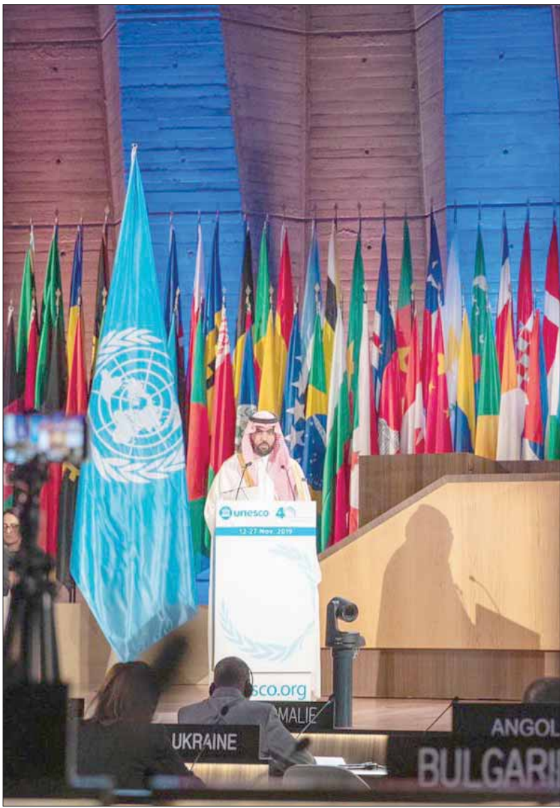
الرياض، الشرق الأوسط

ويبين أن المملكة ستستضيف في شهر مارس (نار) من العام المقبل، القمة العالمية للنكاد الإصطناعي التي قال عنها الأمير بدر بن عبد الله إنها «ستمثل ملتقى سنوياً عالمياً لتبادل الخبرات وعقد الشراكات بين الجهات والشركات الفاعلة في عالم البيانات والنكاد الإصطناعي محلياً ودولياً، لوضع هذا العلم المتطور في سياق خدمة البشرية مجعاً، مؤكداً أن أمام الدول الأعضاء بلورة الرؤى التي وافق، والتأكيد للعالم بكل مكوناته، «لنا نغزير وفي نوابنا النجاح في بلورة أهداف هذه المنظمة لما يخدمهم جميعاً، بالتعاون والتكامل، بدأ بيد... لعالم أفضل».