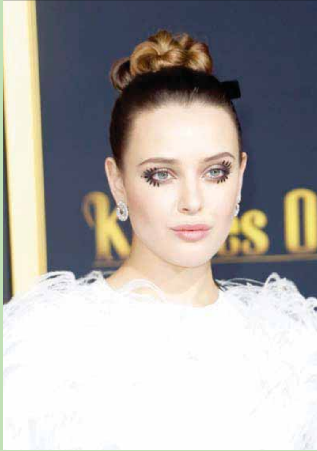
المثلة الأسترالية كاثرين لانغفورد حضرت العرض الأول لفيلم سحب «نايفز أوت» في لوس أنجلوس بولاية كاليفورنيا (إ.ب.أ)

هذه الظاهرة الشاذة، والعياذ بالله، انتشرت في بعض البلاد كنوع من الموضة، والعوام يطلقون على المثلي فيها: خرنتي لا ذكر ولا أنثى.