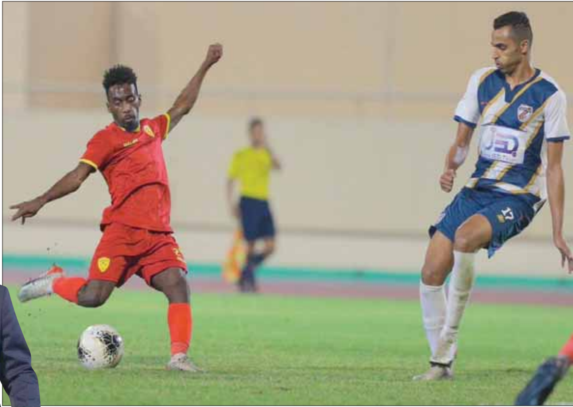
من مباراة القادسية الأخيرة أمام فريق جدة

خسر في مباراة واحدة حتى الآن بسبب «احتجاج»