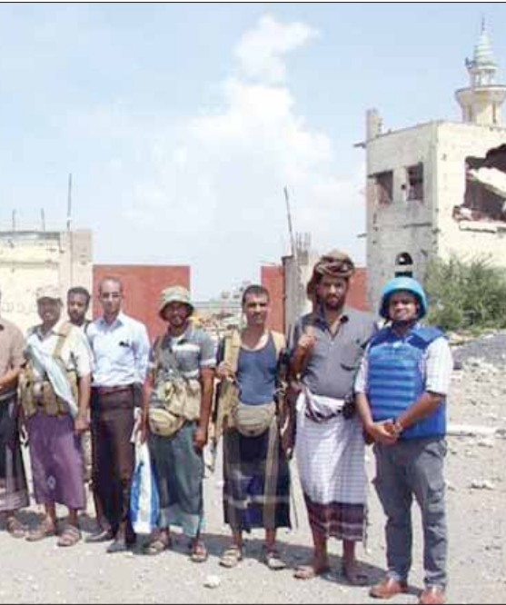
الجنرال أبهاجت غوها لدى وقوفه وفريقه على إحدى نقاط المراقبة المشتركة بين الحكومة والحوثيين في الحديدية أكتوبر الماضي

يقول مصدر مطلع في البعثة الأممية إلى الحديدية (أونها): «لقد حدث انخفاض كبير في التصعيد على الأرض منذ إنشاء 5 مراكز مراقبة على طول الخطوط الامامية لمدينة الحديدية. وهناك