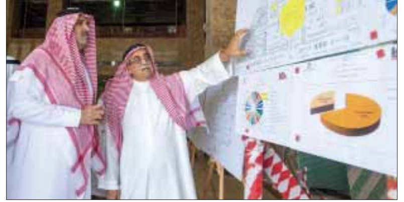
الأمير فيصل بن سلمان خلال تفقده مراحل العمل بالمشروع