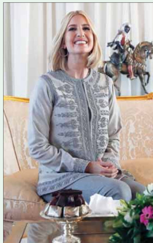
الرباط، «الشرق الأوسط»

أبهرت مستشارة الرئيس الأميركي، إيفانكا ترمب، طفلة مقامها بالمغرب، المتابعين لجديد عالم الموضة بأزياء من إبداع المصممة المغربية فضيلة الكادي، جعلتها تبدو بمظهر «بلدي» جديد يستمد رفعة من مهارة عريقة.