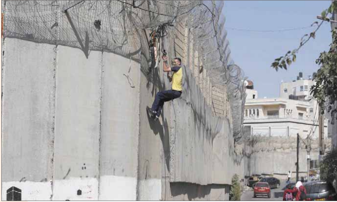
صورة أرشيفية لفلسطيني يحاول تسلق الجدار الفاصل بين الضفة الغربية والقدس

من جانبها، أصدرت حماس على عقد اجتماع قيادي قبل صدور المرسوم، وطلبت توضيحات حول محكمة الانتخابات وانتخابات المجلس الوطني. ويفترض أن تعود لجنة الانتخابات المركزية إلى قطاع غزة قريباً من أجل استكمال المشاورات، وعقد الأحمد، متسائلاً: «على ماذا نتحاور؟ في حوار في القانون. لجنة الانتخابات وفق القانون تجتمع بالفصائل للتوقيع على وثيقة شرف لاحترام القانون