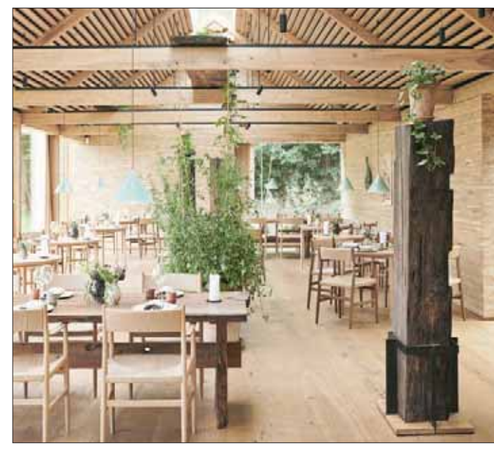
مطعم نوما في كوبنهاغن من أفضل مطاعم العالم لعدة أعوام

المركز الثالث أسادور إكستباري، إكستوندو، إسبانيا ارتفع مركز هذا المطعم من المركز العاشر في العام الماضي إلى المركز الثالث هذا العام ويديره الشيف فيكتور أرجونينوز الذي يشتهر بأنه يستخدم أسلوب الشواء في طهي معظم وجبات الزبائن حتى تحمل رائحة الشواء واللحم. وشارك فيكتور والده وعمه في شراء المطعم وعلم فن الطهي بداية من أسلوب الباربيكيو ويتخصص في شواء البحريرات والأسماك واللحم البقري المشوي. وحصل فيكتور على نجمة من ميشلان لتفوقه في أسلوب الطهي على النار المشوفا. ويشتهر بين زبائن