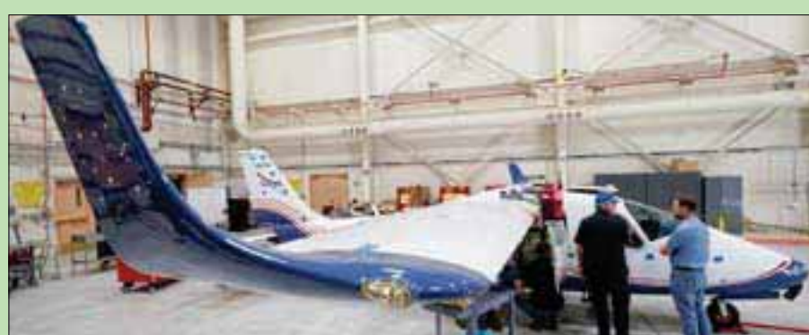
الطائرة ماكسويل الكهربائية بالكامل التي تصممها وكالة ناسا

قاعدة إدواردز الجوية ولاية كاليفورنيا، «الشرق الأوسط»