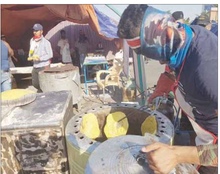
خباز يعمل بهمة لإطعام المظاهرين

متوفرة على مدار اليوم، ولعل ذلك مثل نوعاً من الإغراء لبعض الفئات الفقيرة، دفعهم للمواظبة على الحضور بشكل يومي ودون انقطاع.