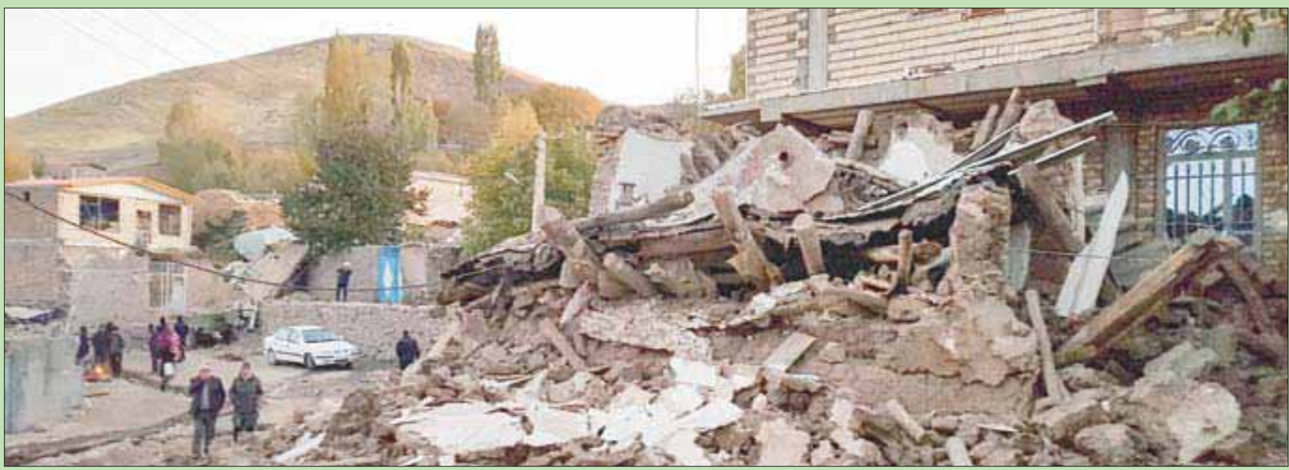
صورة ورعتها وكالة «تسنيم» لتداعيات الزلزال الذي ضرب قرية فارنكيش جنوب شرقي تبريز (أفب)

وكانت إيران قد أكدت، الخميس، أنها استأنفت تخصيب اليورانيوم في «فردو»، في خطوة تمثل قدراً أكبر من التخلي عن إنتاج النووي الذي ابرمته عام 2015 مع الدول الكبرى بعد انسحاب الولايات المتحدة منه. ويحظر الاتفاق إنتاج مواد نووية في «فردو»، التي تعد موقعاً يمثل