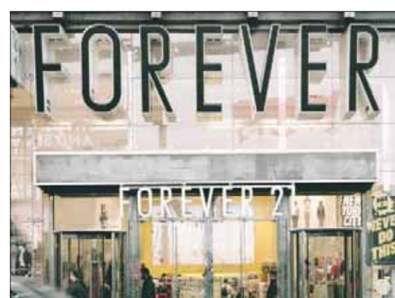
أحد فروع «فوريفر 21» في الولايات المتحدة

الآية تحديداً تعكس مدى محبة الرب القدير لعباده، وكان يأمل أن يدرك الآخرون ماهية هذه المحبة. وقال المؤلفون السابقون بالشركة إن نسخ الكتاب المقدس كانت في مواضع ظاهرة للعيان داخل قاعات المؤتمرات، وعلى مكتب السيد تشانغ أيضاً. وقال المؤلفون إنه لهم المعاد لرؤساء الأقسام أن تكون لهم روابط عائلية أو دينية مهمة ولكن لم تكن لديهم خبرات كافية في العمل مع تجار التجزئة الآخرين في ميادين العمل.