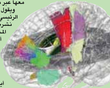
صورة ثلاثية الأبعاد للدماغ البشري (جامعة كيس وسترن ريزرف)

حيوية تؤدي وظائف حيوية للجسم، تشريحي هذه التقنية للمسارات المحورية بها، لتكون خطوة أولى، يمكن تكرارها في جميع أنحاء الدماغ، وفق تقرير نشره موقع جامعة كيس وسترن ريزرف، بالتزامن مع نشر الدراسة. ومنطقة «تحت المهاد»، هي منطقة