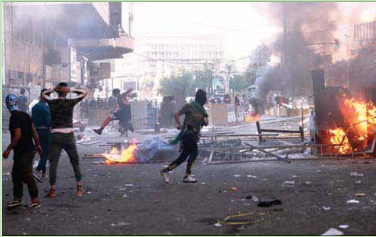
مواجهات بين المحتجين وقوات الأمن وسط بغداد أمس (أ.ب)