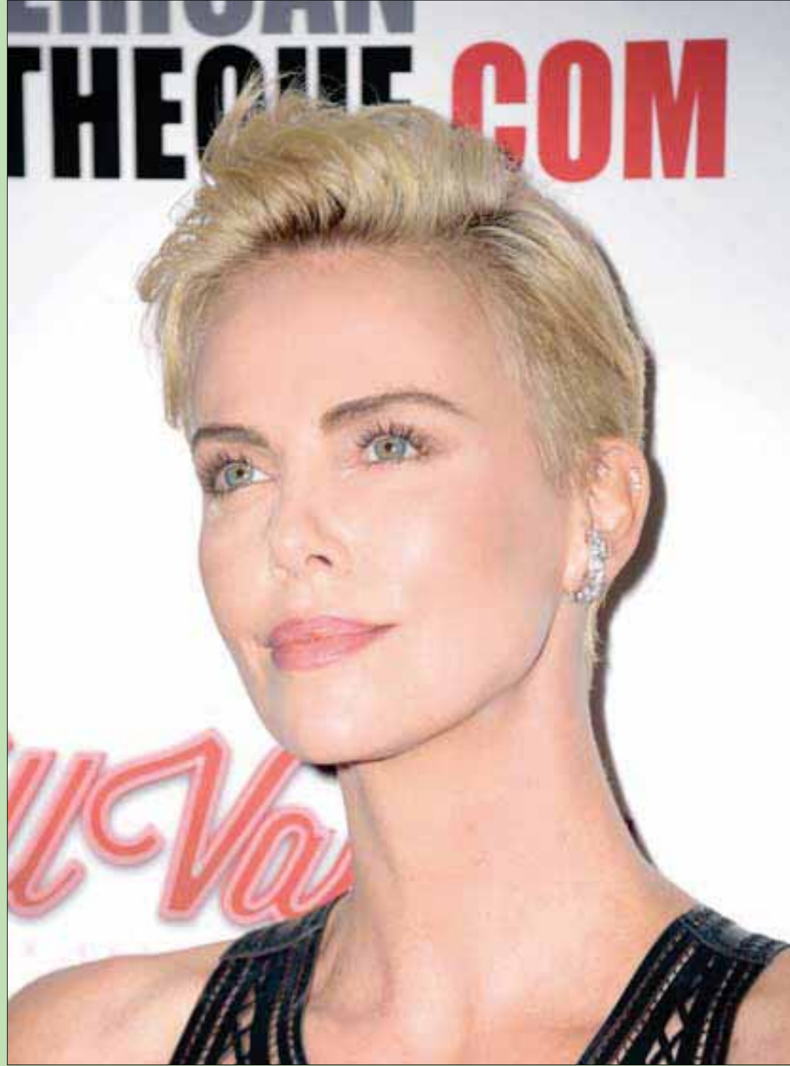
تشارلين ثيرون الممثلة الجنوب أفريقية حضرت حفل توزيع جوائز «أميركان سينماتيك» في بيغري هيلتون في لوس أنجلوس

أما النموذج أو اللغز الثاني، فقد قرأت عنه في جريدة «الراي» الكويتية، التي ذكرت عن مصدر أمني أن مخموراً يحمل جنسية عربية تأسس مع رجال الأمن، بعدما القوا القبض عليه، وطلب منهم أن يتركوه ليؤدي صلاة الفجر. حاولوا بشتى الطرق إسكاته، والتستر عليه، غير أنه «لتفلظ عليهم» بأقذر الكلمات، عندها اضطروا أن يقادوه مكباً إلى المخفر. وحسناً ما فعلوه، وإلا «كيف تركب معانا، سكران «طينة»، وفوق ذلك تريد أن تصلي الفجر في المسجد؟» وهذه هي قمة «البجاجة» مع «قوية» العين. أما في الإمارات، فقد ذهب رجل إلى المحكمة، معترفاً أنه قام بالزنى - والعيان بالله - عدة مرات، رغم أنه محصن (أي متزوج)، وطلب أن يقام عليه الحد بالرحم. وقالوا له في المحكمة إن بإمكانه العدول عن اعترافه، وكرهوا سؤاله أكثر من 10 مرات، إلا أنه أصر على الاعتراف، وأخذت المحكمة تناقشه في اعترافاته؛ حيث لوحظ عدم إكترائه، واستمر «راكبا راسه». وبعد مشاورات بين هيئة المحكمة والنيابة العامة، قررت المحكمة تأجيل القضية إلى جلسة في الشهر المقبل، وذلك لحين تعيين محام للدفاع عنه!