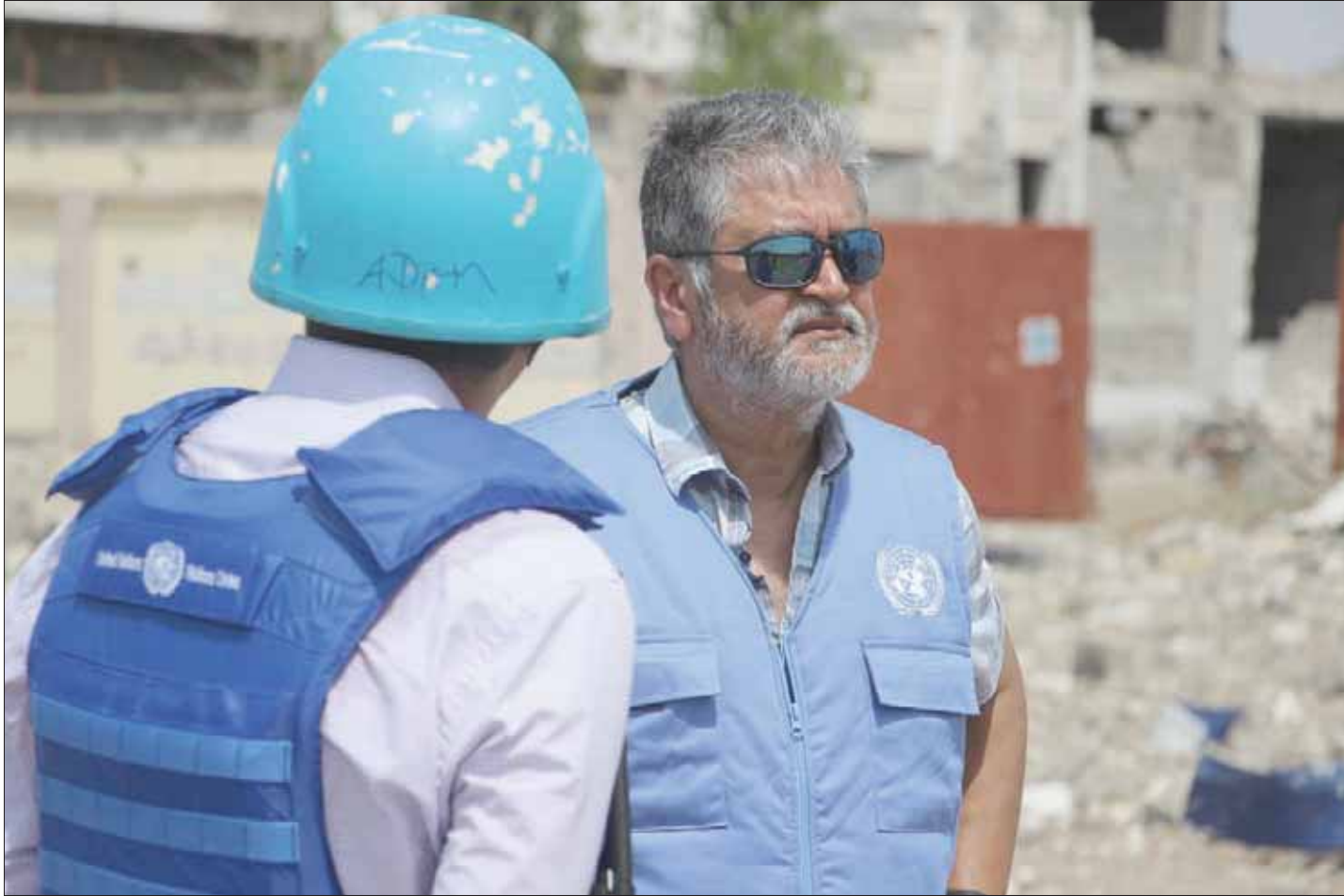
الجنرال أهبجيت غوها مع عنصر أممي في إحدى النقاط المشتركة لمراقبة وتثبيت وقف النار في الحديدية يوم 19 أكتوبر الماضي

الحوثيين عن الجريمة. وعرض المختب، في بيان صدر الجمعة، تفاصيل الهجوم تحت عنوان «ضربات تلحق أضراراً بمستشفى رئيسي يخدم مئات الآلاف من اليمنيين». وقال البيان: «تشير التقارير الأولية إلى أن المستشفى الرئيسي الذي يخدم مئات الآلاف من اليمنيين في المخا بمحافظة تعز على ساحل الغربي لليمن، قد تعرض لأضرار بالغة جراء الضربات التي وقعت في 6 نوفمبر (تشرين الثاني)». وأوضح أن الضربات أودت بحياة 6 أشخاص من الضربات التي تشهدها المستشفى الذي تديره أطباء بلا حدود على إغلاق أبوابه، وتم تدمير مخزونه الكبير الذي يحوي مستلزمات طبية». ونسب البيان إلى غراندني قولها: «المنشآت الطبية محمية بموجب القانون الإنساني الدولي، وسيحرم مئات الآلاف من الأشخاص على طول الساحل الغربي من يحتاجون لمساعدات طوارئ، منهم، والمئات ممن هم بحاجة تدخلات جراحية لإنقاذ الأرواح كل شهر، من الحصول على المساعدة التي يحتاجونها بسبب هذه الضربات».