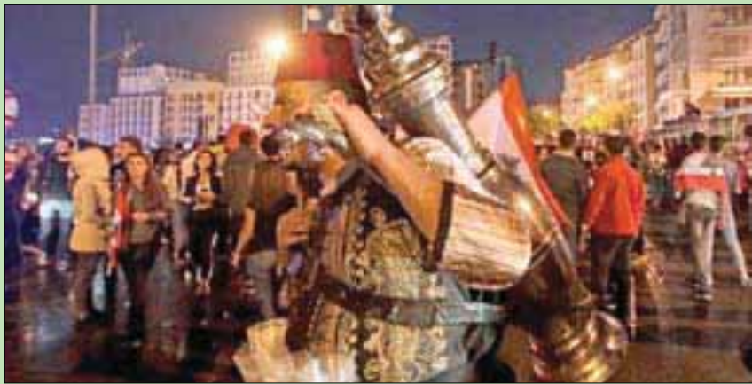
لبناني يبيع القهوة وسط المظاهرات في بيروت