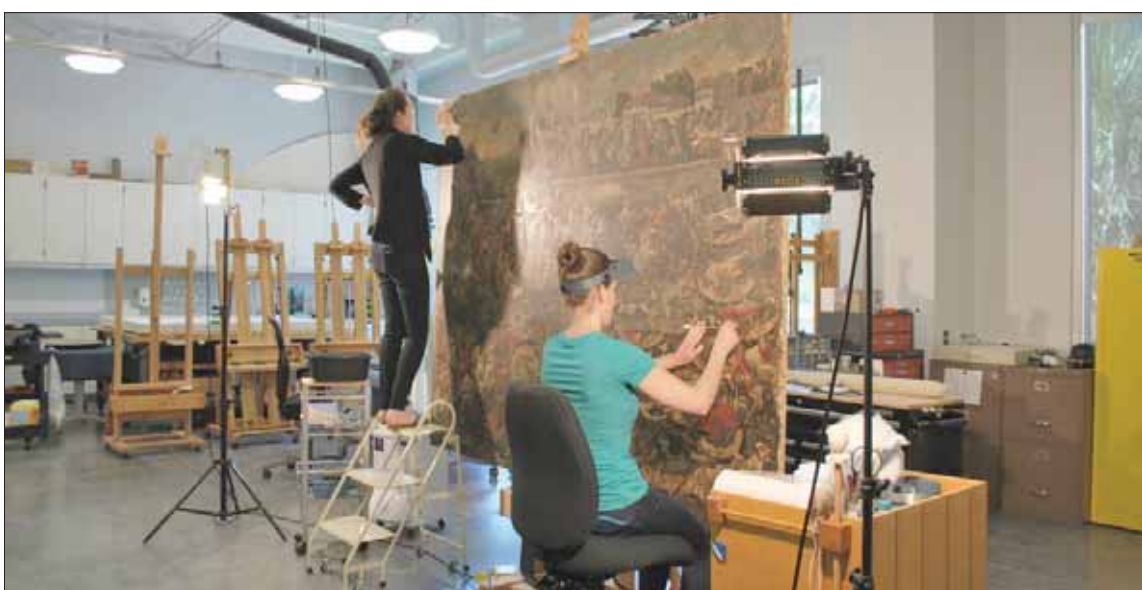
تمكن متحف «رينغليغ» بولاية فلوريدا من استعادة وترميم لوحة «سباق البطح» التي ترجع إلى أوائل القرن 18

من بين المقتنيات الملبس التي كان السكان الأصليون يرتدونها خلال الاحتفالات في المجتمعات القديمة، وأصافت تقول: «لدينا العديد من أغطية الرأس التي تعتبر عن شخصيات رفيعة المستوى في المجتمع. وكان يرتديها الزعيم الوراثي للامة، غير أن جزءاً مرصفاً بالصدف كان مفقوداً. ولبيت لدينا المهارات الكافية لاستنساخ تلك المقتنيات». وتواصل المتحف مع الفنان ديفيد بوكسي، من قبيلة تسميشيان الأصلية في بريتيش كولومبيا الكندية. ولقد حصل على اصداف مشابهة، وقطعها إلى قطع معينة ثم قنماً بإضافتها إلى القطعة. وسوف يتم عرض الجهود التي استمرت ثلاث سنوات كاملة عبر قنوات الإعلام الرقمية الخاصة بالمتحف.