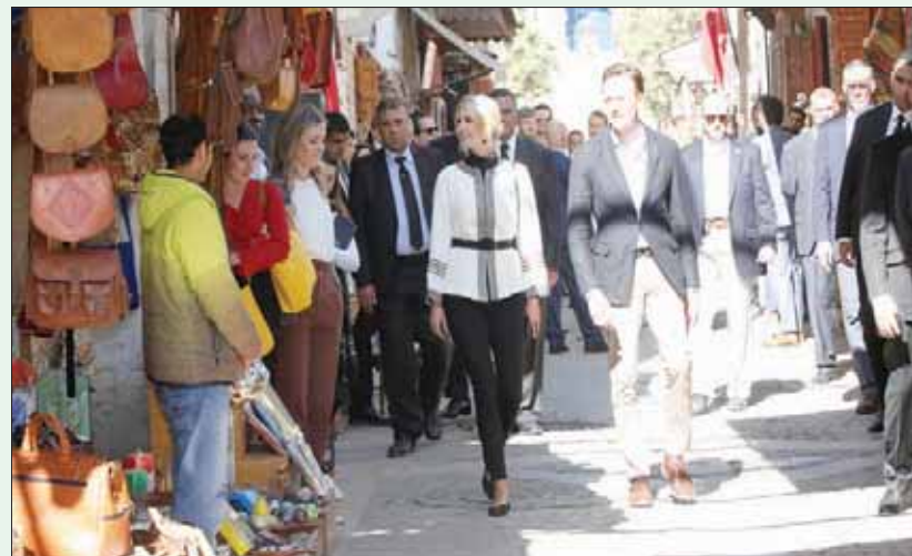
إيفانكا ترمب ارتدت سترة بيضاء مع حزام اسود في جولة بالمدينة القديمة في الرباط