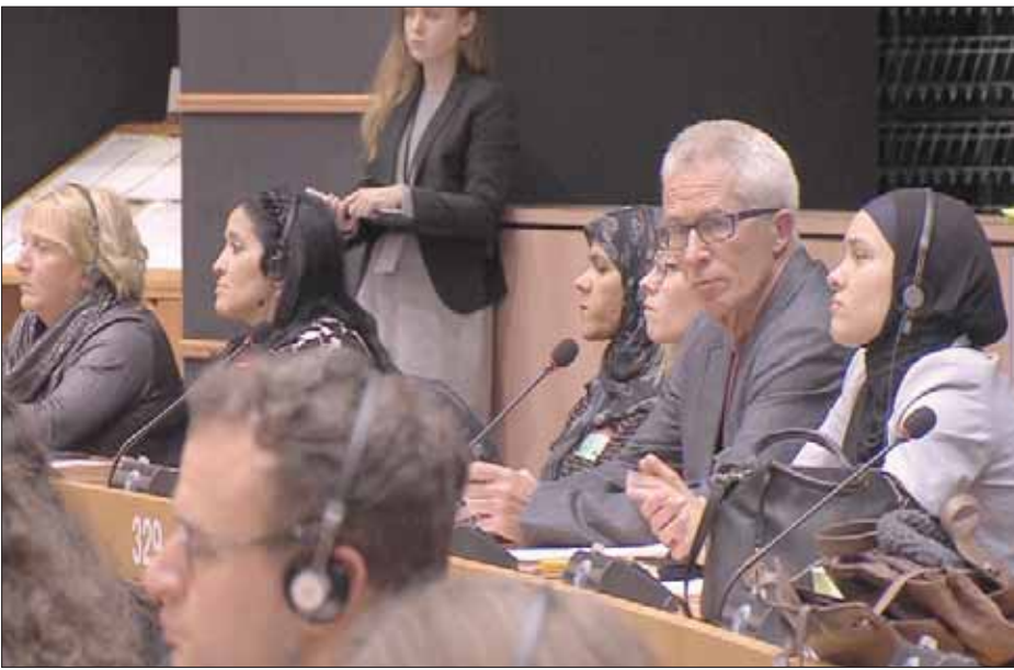
أمهات داخل البرلمان الأوروبي يطالبن باستعادة أبنائهن وأحفادهن من معسكرات «الدواعش» (الشرق الأوسط)

بالفرنسية، وقالت: «أنا هنا للحصول على إجابة عن سؤالي: ماذا يستطيع البرلمان الأوروبي أن يفعل لإعادة أبنائنا وأطفالهم الصغار، خصوصاً أننا نعاني وسئمنا بسبب كثرة النقاشات والاستماع، وكأننا في حلقة مفرغة؟»، مضيفة: «هؤلاء الأطفال يحملون الجنسية البلجيكية، ومع ذلك فإن بلجيكا لا تتحرك، ونحن نريد إعادةهم بسرعة، اليوم قبل الغد». والسيدتان شاركتا في جلسة نقاش لعدة لجان داخل البرلمان الأوروبي حول وضعية الأطفال الصغار