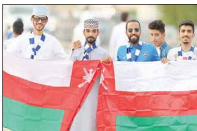
عمانيون ضمن مشجعي فريق الهلال في النهائي أمس