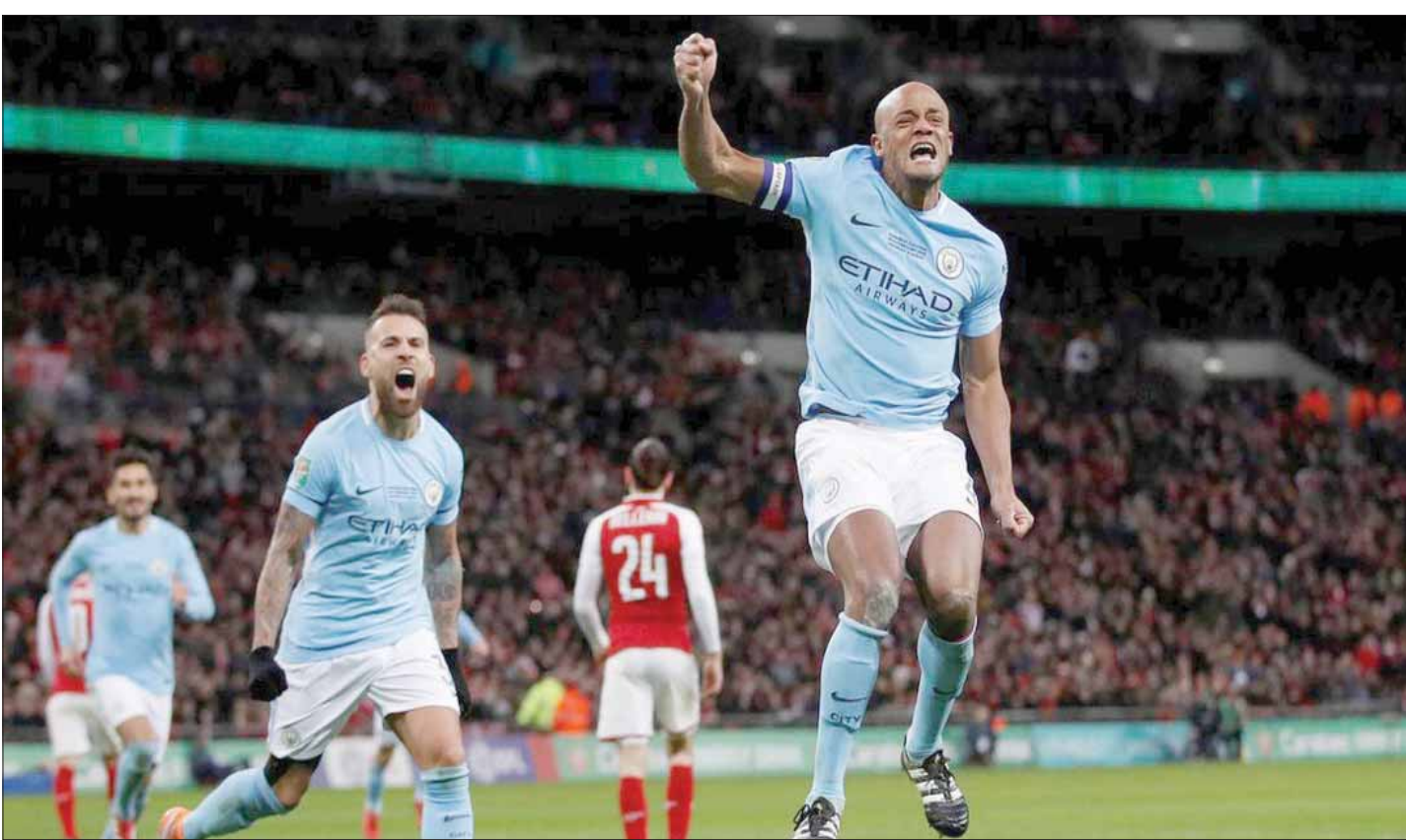
افتقد غوارديولا شخصية كومباني القوية

وعلى مدار العقد الماضي، دخل غوارديولا في خلافات مع بايا توريه وزياتان إبراهيموفيتش وصامويل إيتو، وعلى الرغم من وجود مبررات لذلك داخل أرض الملعب، فإن العامل المشترك بين هؤلاء اللاعبين الثلاثة هو قوة الشخصية. ربما تكون هناك انتقادات تتسم بالعاطفية في هذا الشأن - كمال كرة القدم التي يقدمها غوارديولا لا يتفق مع شخصيات اللاعبين الذين يلعبون بشكل حماسي وفردى - لكن الحقيقة هي أن أي فريق يرغب في الفوز بالبطولات والألقاب يجب أن يضم مجموعة مختلفة من اللاعبين والشخصيات، وهو ما يساعد الفريق على التعامل مع الاحتمالات المختلفة التي يمكن أن تتكشف أثناء المنافسة القوية. ولو تخلى غوارديولا بعض الشيء عن القواعد التي يلتزم بها في عمله التدريبي، فكان من الممكن أن يحقق نجاحاً أكبر.