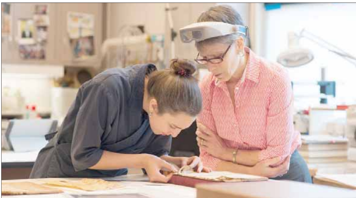
خلال أعمال ترميم مخطوطة من القرن 12 في متحف «الترن»