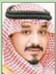
الأمير خالد بن بندر بن سلطان