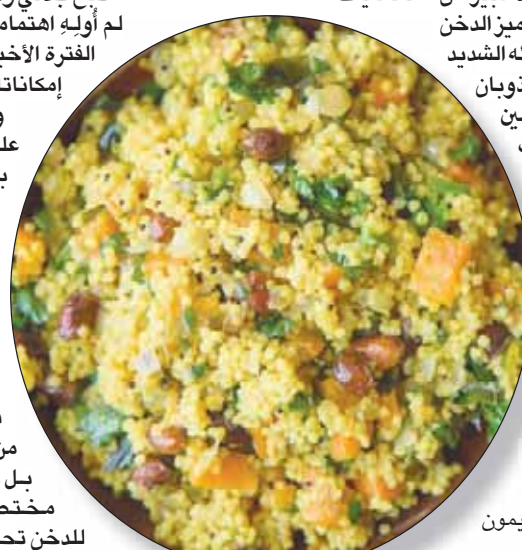
أرز بالدخن والليمون

هناك نوع آخر من الدخن يطلق عليه «ذيل الثعلب» غني بالمنغنسيوم الذي يساعد في تخفيف ضغط الدم، بجانب