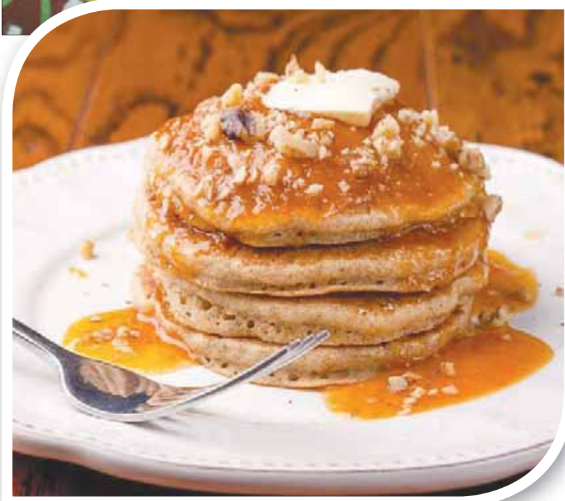
الدخن يدخل في وصفات كثيرة منها «البان كيك»

حتى رئيس الوزراء الهندي ناريندرا مودي أعلن في وقت قريب أن الهند سوف تعمل على إطلاق «ثورة دخن» لضمان توفير التغذية السليمة للمواطنين. وأوضح مودي أن العالم بدأ في التحول نحو أنواع الغذاء التي هجرها الهنود لارتباطها بالفقر وضيق ذات اليد. والآن، حان الوقت لإعادة فتح كثر العناصر الغذائية الغنية داخل البلاد.