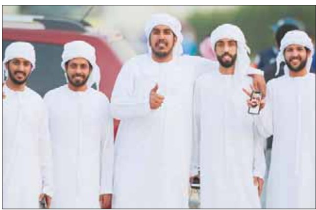
مشجعون من الإمارات حضروا مؤازرة الهلال أمس

وكان لافتاً أمس وجود الآلاف من جماهير النادي الضيف والذين استغلوا إطلاق الملكة للتأشيرة السياحية، الأمر الذي مكن اليابانيين لأول مرة منذ سنوات من الحضور بهذه الكثافة خلف أحد فرقهم على أرض المملكة.