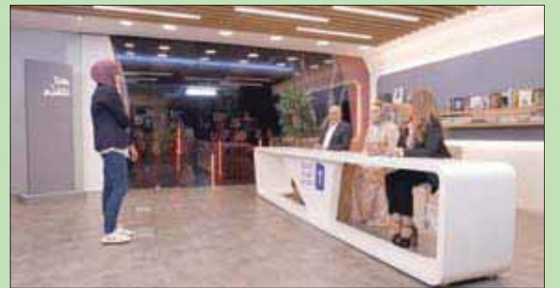
جانب من فعاليات المسابقة (الشرق الأوسط)