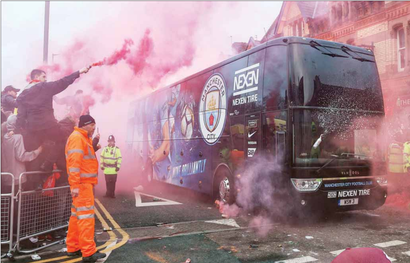
مشجعو لليفربول يستقبلون حافلة سيتي بحفاوة قبل مواجهة دوري الأبطال... ولا يوجد تاريخ من العداوة بين مشجعي الفريقين

ولا يعد هذا السيناريو جديداً على كرة القدم الإنجليزية أو حتى على لليفربول؛ حيث سبق أن قاد بوب بيزلي لليفربول للفوز باللقب الأوروبي عام 1978 ثم قاده للحصول على لقب الدوري الإنجليزي الممتاز في الموسم التالي، كما فاز نوتنغهام فورست، بقيادة برايان كلوف، باللقب الأوروبي عام 1979 بعد موسم من الفوز بقلب الأول والوحيد للدوري الإنجليزي الممتاز. وإذا تمكن مانشستر سيتي وليفربول من تكرار لقب السنيناريو، فإن التاريخ سينطبق كثيراً إلى هذه المنافسة الشرسية بين الناديين، سواء على المستوى المحلي أو القاري.