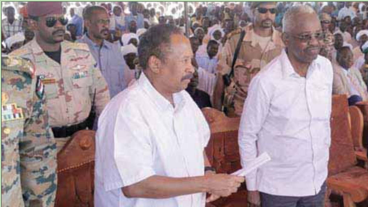
رئيس الحكومة الانتقالية في السودان عبد الله حمدوك خلال زيارة للفاشر في شمال دارفور قبل أيام

الحرية والتغيير»، وجدي صالح، إن قرار عودة قيادة الحركات المسلحة قبل توقيع اتفاق السلام النهائي، يؤكد أن إرادة الجميع تتجه نحو السلام.