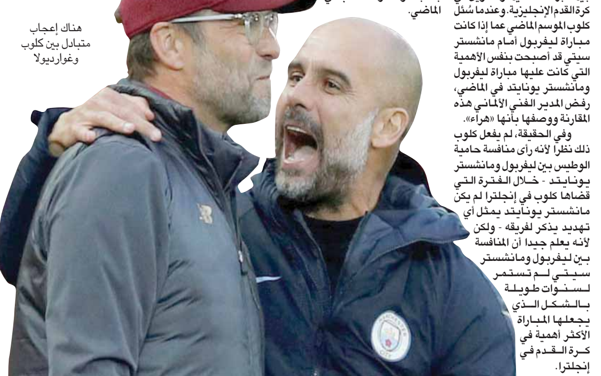
هناك إعجاب متبادل بين كلوب وغوارديولا

المديرين الفنيين للنادية التي تتنافس على البطولات - واعتقد أن نفس الأمر ينطبق على جمهور الناديين أيضاً. علاوة على ذلك، لا يوجد تاريخ حافل من العداوة بين مشجعي لليفربول ومانشستر سيتي، حتى لو تعرض غوارديولا لانتقادات قوية من جمهور لليفربول على ملعب «أنفيلد» خلال المواجهة بين الفريقين في دوري