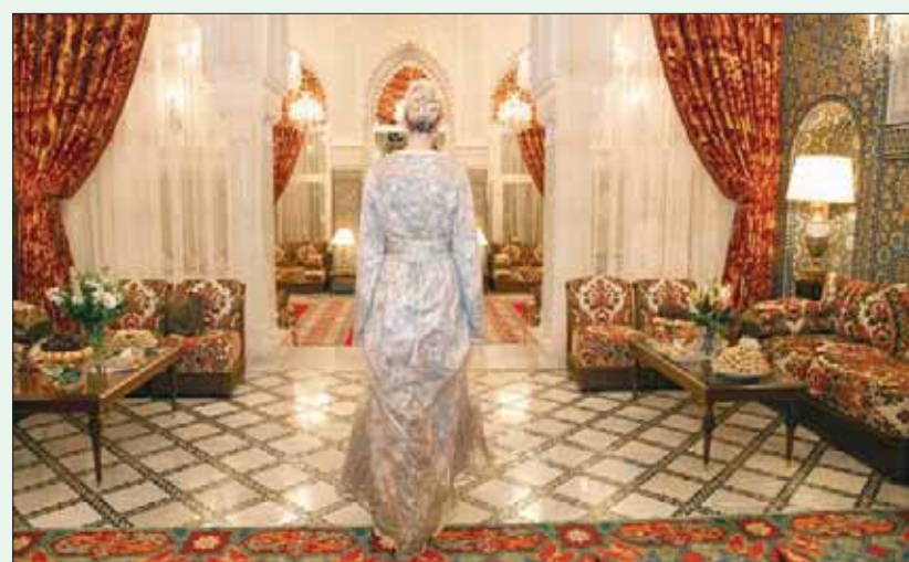
... وقطعنا من تصميم المغربية فضيلة الكادي