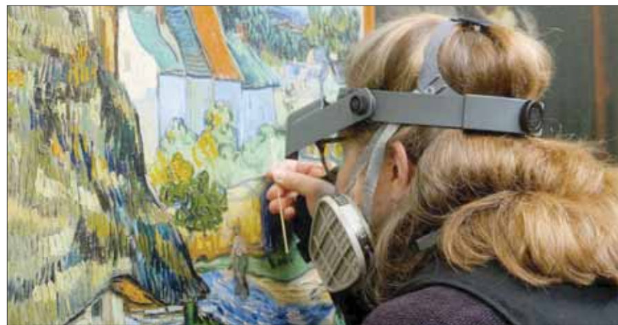
جهود تنظيف وترميم لوحة «منازل أوفيس» للفنان فنست فان غوخ