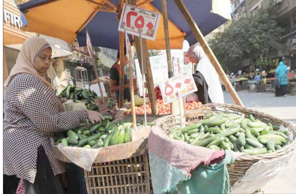
مصرية تشتري الخضراوات في إحدى أسواق القاهرة

التضخم في البلاد. وأضافت الوكالة أن تراجع التضخم يمنح البنك حافزاً جديداً من أجل طرح مزيد من خفض في سعر الفائدة خلال اجتماعه المقرر الأسبوع المقبل، ومن ثم إنعاش بيئة الأعمال مع مراعاة تأثير ذلك للخفض المحتمل على مصالح المستثمرين في الدين المحلي، الذين يعدون مصر وجهة مفضلة للاستثمار تمنحهم أفضل سعر للعائد مقارنة بمخاطبتهم من الأسواق الناشئة. ولفتت «بلومبرغ» إلى أن 6 من بين 7 خبراء اقتصاديين توقعوا خلال استطلاع أجرته الوكالة الأميركية، خفض المركزي سعر الفائدة بمقدار 100 نقطة مئوية خلال اجتماعه في 14 من نوفمبر، مشيرة إلى أن معدل التضخم ياتي ضمن النطاق المستهدف من البنك المركزي والبالغ 9 في المائة، زائد أو ناقص 3 نقاط مئوية، بحلول الربع الرابع من العام المقبل.