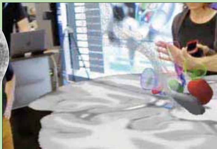
نظارات هولولنز تتيح التفاعل مع أجزاء الدماغ (جامعة كيس وسترن ريزرف)

وركز الباحثون في المشروع الذي تم الإعلان عنه، أول من أمس، في دورية Neuron، على منطقة تحت المهاد، هي منطقة