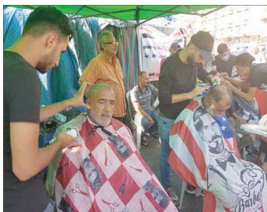
حلاقون يقدمون خدماتهم لمحتجي ساحة التحرير في بغداد

ويبدو أن الناشطين والجهات الفاعلة في الاحتجاجات، وبعد قرار نصب الخيم والبدء باعتصام مفتوح منذ 25 أكتوبر (تشرين الأول) الماضي، كانوا وما زالوا مدركين لأهمية تقديم الخدمات الضرورية للمحتجين بهدف الإبقاء على زخم المظاهرات والاعتصامات متواصلاً، لذلك يمكن أن يتحول في ساحة التحرير ملاحظة أن معظم الخدمات وخاصة فيما يتعلق بجانب الماكولات والمشروبات