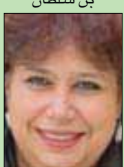
د. إيناس عبد الدايم