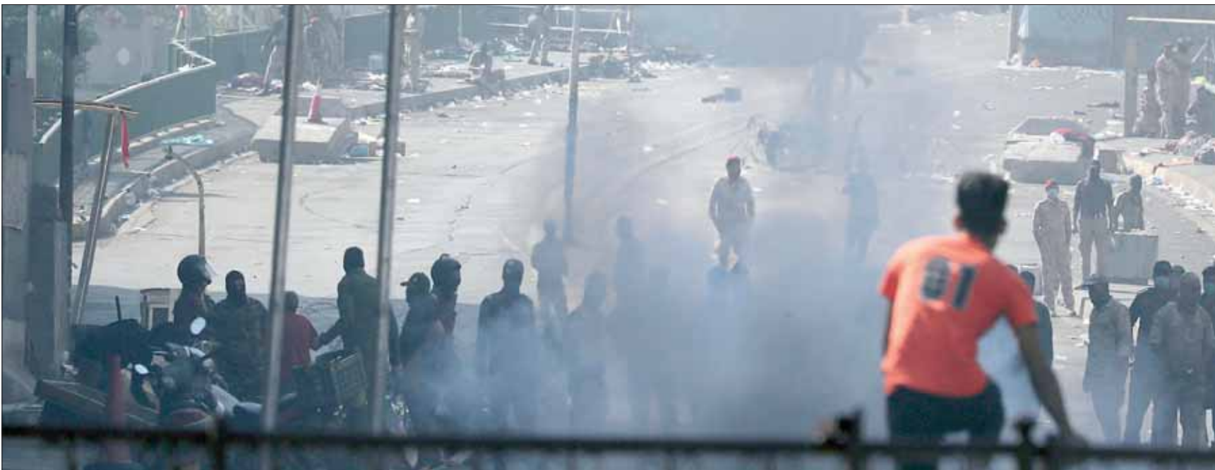
قوات مكافحة الشغب تستخدم قنابل الغاز لتفريق محتجين على أحد جسور بغداد أمس