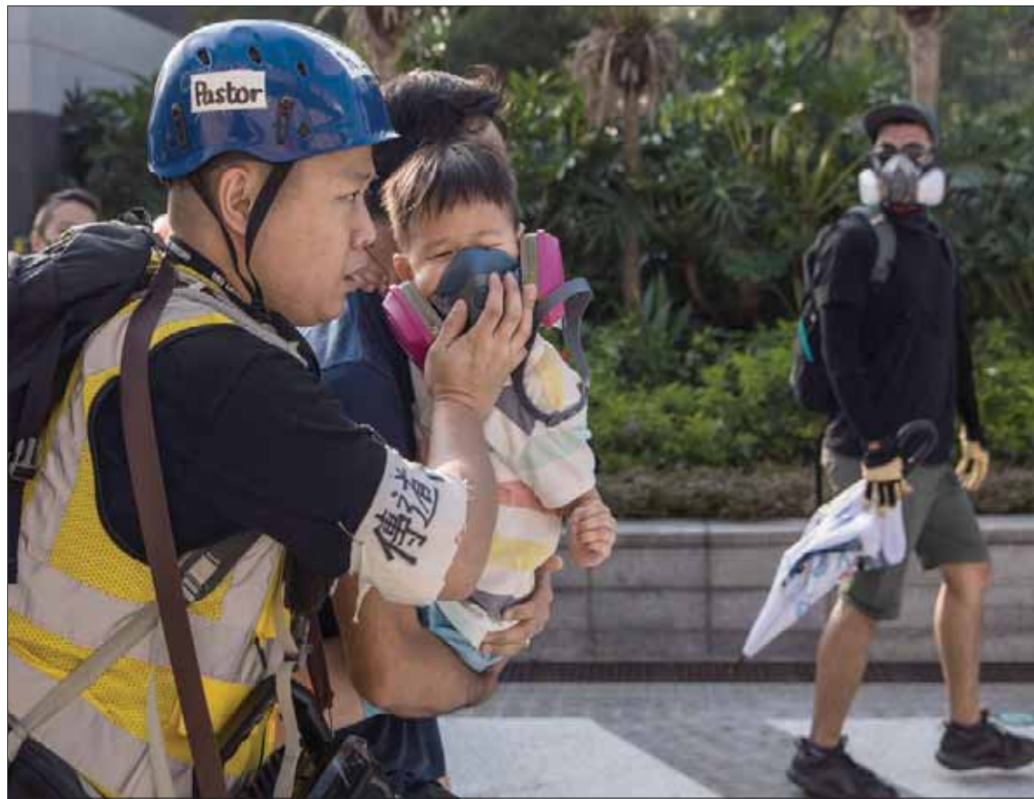
رجل يستخدم قناعاً لحماية طفل من الغاز المسيل للدموع في منطقة تسيم شيا تسوي بهونغ كونغ أمس

هونغ كونغ - لندن- «الشرق الأوسط»، مع تزايد الحشود الذين رددوا هتافات مناهضة لعنصر الشرطة.