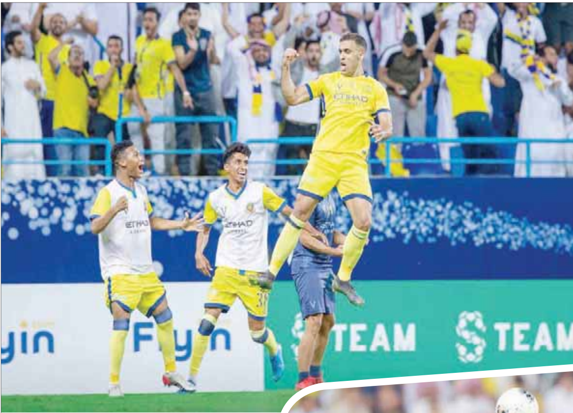
حمد الله يحتفل بهدف الفوز على الهلال (الشرق الأوسط)