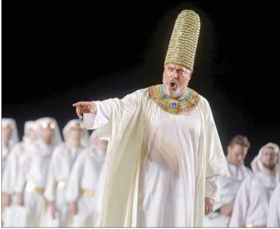
جانب من عرض «أوبرا عايدة»