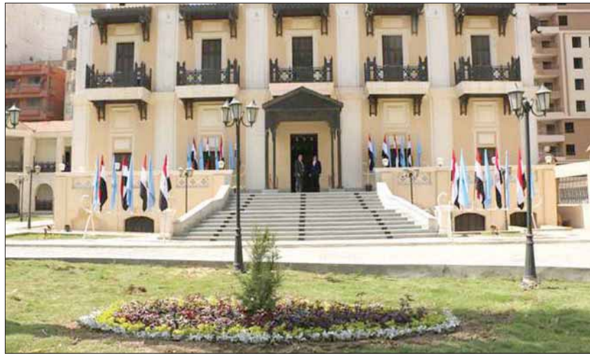
دبي، مساعد الزياتي

محافظة حلوان، بعد فصلها عن القاهرة، لكن بعد انضمامها للقاهرة وضع برنامج لتطوير القصر باعتباره تحفة فنية ذات طراز معماري متميز، ومن الصعب استخدامه كمقر إداري. وصاحبة القصر السابقة «الأميرة خديجة»، هي ابنة الخديوي توفيق، سادس حكام أسرة محمد علي باشا، الذي حكم مصر من 1879 إلى 1892، وشيد القصر عام 1895، لتسكنه الأميرة خديجة، لكنها أهدته إلى وزارة الثقافة في 1902، ليكون مستشفى لأمراض الصدر. وعلى هامش افتتاح القصر، أطلقت مكتبة الإسكندرية معرض «رحلة الكتابة في مصر» الذي يستعرض أهم المحطات الرئيسية للتدوين، وأهم صورته في مصر منذ أقدم العصور حتى العصر الحديث، وينقسم إلى ثلاثة أقسام رئيسية يسرد كل منها طبيعة التاريخ والحضارة من خلال الصور المختلفة للتدوين، التي شهدتها مصر بتنوع الديانات والجماعات المختلفة في أرضها، ويحتفي المعرض بالخضوط والأبداعات النادرة التي صاحبت الهجرة غليبية واحتضنتها أرض مصر مثل: النبطية، والأشورية، واليونانية، وغيرها.