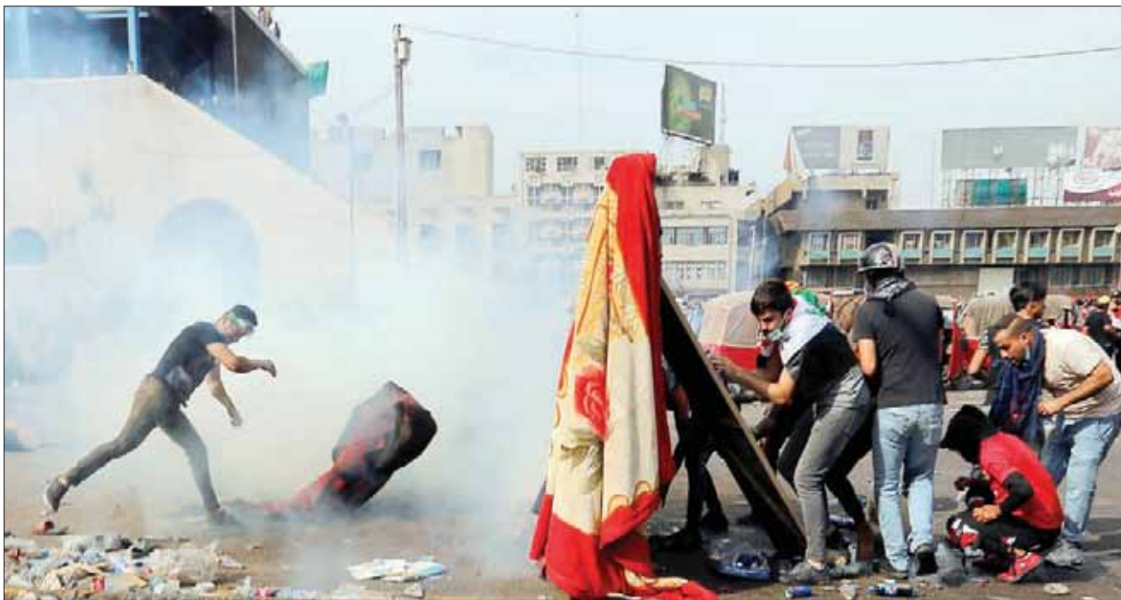
مواجهة بين قوات الأمن ومحتجين في بغداد أمس

تجمع مئات المحتجين في ساحة التحرير بوسط بغداد، أمس، في تحدٍ جديد بعد ليلة طويلة من المظاهرات التي يقوم بها مطالبون بـ«إسقاط النظام»، استخدمت القوات الأمنية لتفريقها الغاز المسيل للدموع. وواصل العراقيون الاحتشاد رغم تخفي حصيلة القتلى 60 شخصاً في الموجة الثانية من الاحتجاجات المناهضة للحكومة التي انطلقت مساء الخميس. وقتل بعض هؤلاء بالرصاص الحي، والبعض بقنابل مسيلة للدموع، والبعض الآخر احتراقاً خلال إضرام الناري في مقر أحزاب سياسية. وقال أحد المتظاهرين لوكالة الصحافة الفرنسية وهو يلف رأسه بالعلم العراقي: «خرجنا لإقالة الحكومة شلغ قلع (كلها من جذورها). لا نريد أحداً منهم».