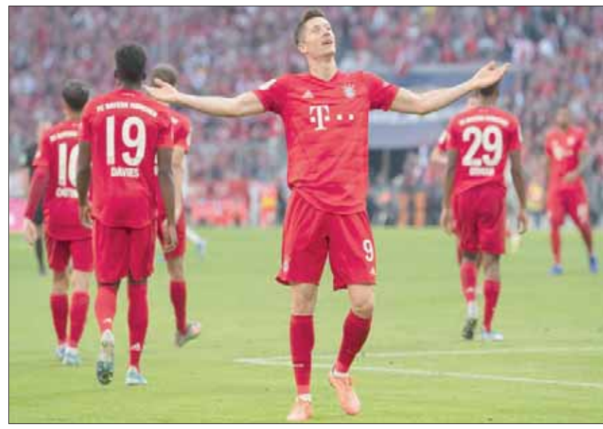
ليفاندوفسكي انفراد بالرقم القياسي لأكثر اللاعبين تسجيلاً للأهداف في المباريات المتتالية

وحتى الآن نجح ليفاندوفسكي في التسجيل في أول 13 مباراة في الموسم على مستوى جميع المسابقات بعد إحرازه 19 هدفاً وسيعادل الرقم القياسي لمولر إذا سجل في شباك بوخوم غداً الثلاثاء في كأس ألمانيا وكذلك خلال المباراة أمام إينتراخت فرانكفورت في البوندسليغا يوم السبت المقبل. وقال المهاجم البولندي إنشادة