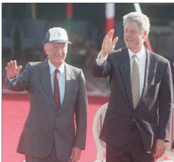
اتفاق وادي عربة بين الأردن وإسرائيل عام 1994 بحضور كليتون والملك حسين ورايين

مشروع القناتين الجريين. وقد ردت الأردنيون بغضب على الإبرارات والمواقف الإسرائيلية. وقرروا عدم تمديد اتفاقية استئجار أراضي الباقورة والنمر، التي سيكون على إسرائيل إعادة لها للأردن في الشهر المقبل. في ظل هذا التدور، وجد الطرفان أنه لا حاجة لإقامة أي احتفال رسمي ولا حتى ندوة سياسية أو نشاط رمزي رسمي، لإحياء ذكرى اليوبيل الفضي لمعاهدة السلام بينهما، ما جعل الباحثة المتخصصة في سياسة الشرق الأوسط وعضو الكنيست (البرلمان الإسرائيلي) السابقة، كيسنيا تسفتولفا، التي عادت مؤخراً من زيارة أكاديمية من عمان، تصف العلاقات بين البلدين بالقول إنها «تجف كما تجف المياه في نهر الأردن».