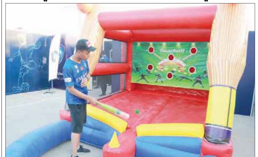
شاب يمارس لعبة البيسبول خلال الفعاليات أمس

الشهر من رابطة دوري المحترفين والبالغة 50 ألف ريال قبل بداية مباراة الهلال والنصر. وفي بادرة رائعة كرمت إدارة نادي الهلال اللاعب خميس العويران نجم المنتخب السعودي وفريق الهلال السابق (شفاه الله) الذي عاد مؤخراً من رحلة العلاج، من جهة ثانية الغت شركة صلة جميع تذاكر جماهير الهلال التي تم شراؤها في «المدج الخاص بفريق النصر» وتم إعادة بيعها لجماهير النصر وذلك تحقيقاً لمبدأ العدل وتطبيقاً للنظمية.