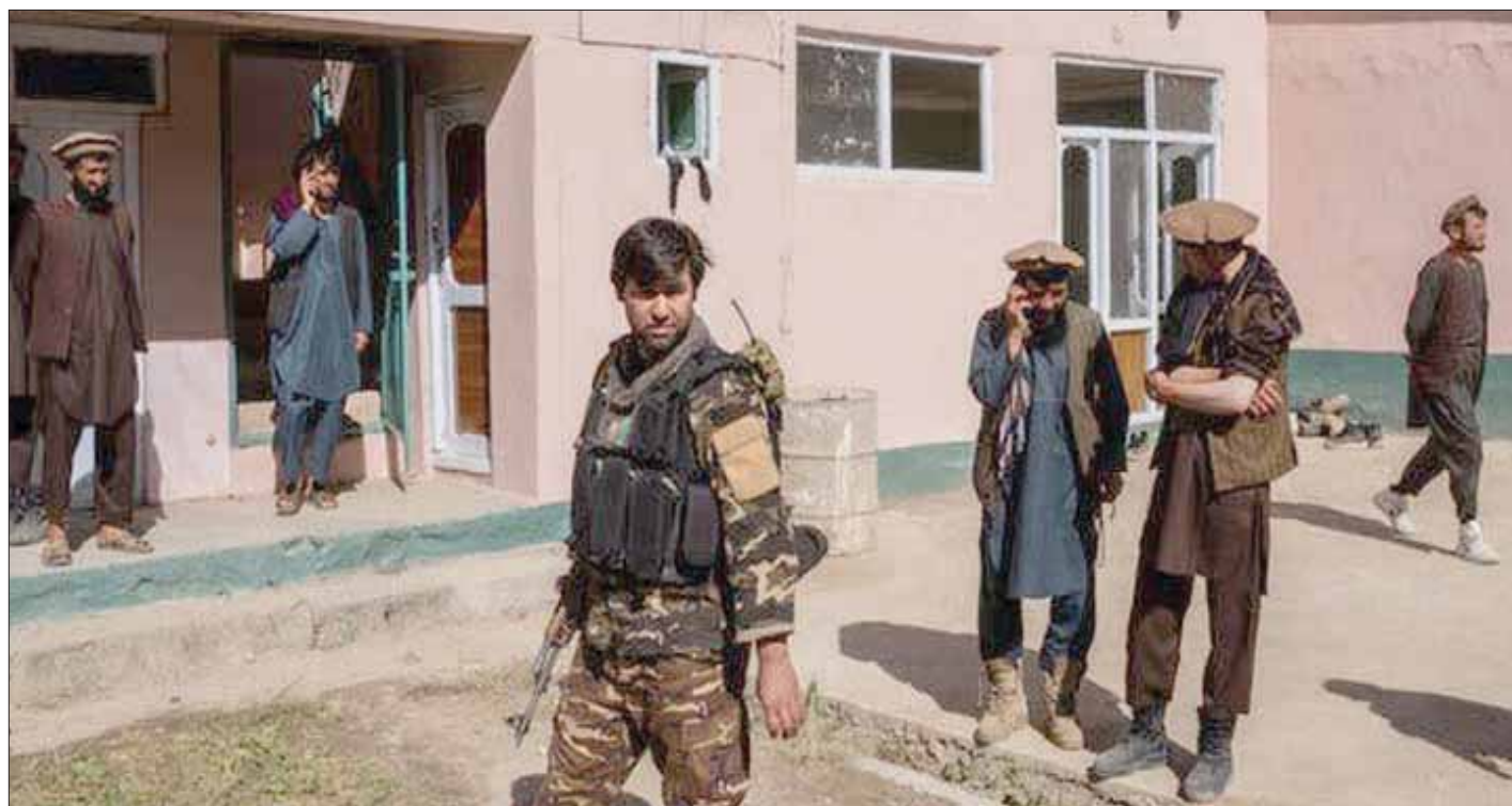
مسؤولون أفغان أشادوا بمميزات «واتساب» في مواجهة «طالبان» التي يعتمد مقاتلوها التطبيق في التواصل فيما بينهم