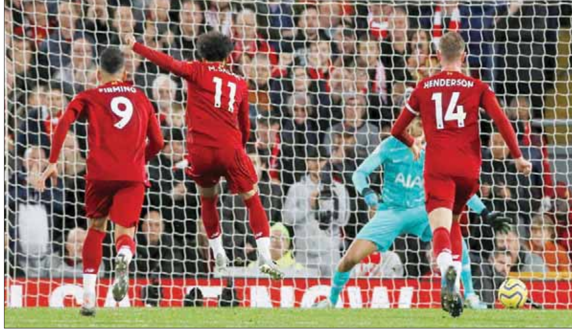
صلاح (رقم 11 في المنتصف) يسجل من ركلة الجزاء ليحسم الفوز للليفربول على توتنهام

وكان بوليسيتش، الذي سجل 14 هدفاً في 34 مباراة مع منتخب الولايات المتحدة، قد انضم