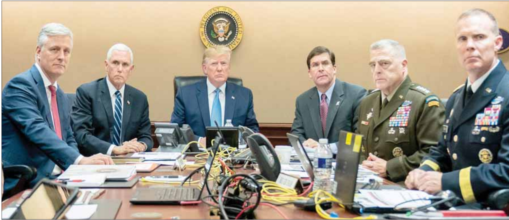
الرئيس الأميركي دونالد ترمب ونائبه مايك بنس ووزير الدفاع مارك إسبر مع أعضاء من فريق الأمن القومي يتابعون في البيت الأبيض اقتحام قوات العمليات الخاصة للمنزل الذي يخبئ فيه البغدادي

التي نشر نفوذهم وارتكاب أعمال إرهابية»، واتخذت بيلوسي في البيان عدم اطلاع مجلس النواب على الغارة العسكرية الأميركية؛ بينما تم إخطار الروس دون كبار قادة الكونغرس. وغردت بيلوسي عبر موقعها على «تويتر» مطالبة إدارة ترمب بتقديم استراتيجيات واضحة حول مكافحة «داعش» إلى الأميركيين. وأشارت سوزان رايس، مستشارة الأمن القومي الأميركي بإدارة الرئيس أوباما، إلى أن «موت البغدادي لا يعني إعلان انتهاء المهمة»، وأضافت: «ما أواجهه هو أن إدارة ترمب متعديماً استراتيجيات واضحة حول مكافحة «داعش» إلى الأميركيين. وأشارت سوزان رايس، مستشارة الأمن القومي الأميركي بإدارة الرئيس أوباما، إلى أن «موت البغدادي لا يعني إعلان انتهاء المهمة»، وأضافت: «ما أواجهه هو أن إدارة ترمب متعديماً استراتيجيات واضحة حول مكافحة «داعش» إلى الأميركيين.