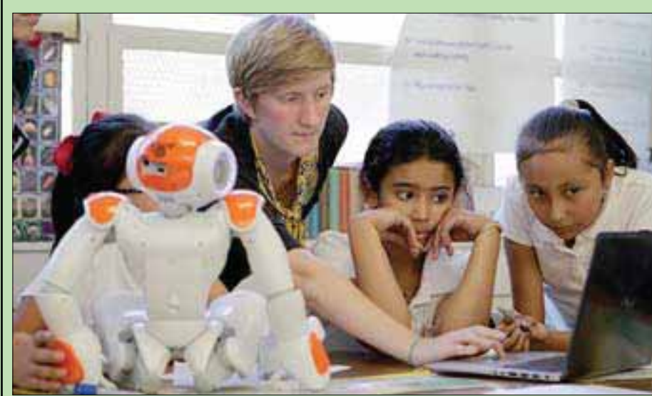
الروبوت يقدم الإرشادات للتلاميذ