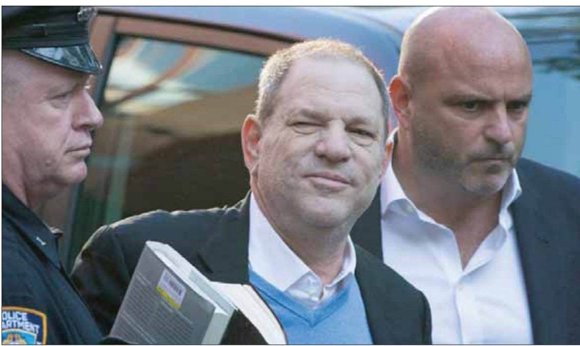
المنتج الأميركي هارفي وينشتاين

وهناك من يؤكد أن بوب وينشتاين ليس الوحيد الذي ينوي العودة إلى العمل الإنتاجي (لم يتوقف تماماً عنه، لكنه تأثر بما حصل إلى حد بعيد) بل هارفي بنفسه. هو على قناعة، فيما يبدو، بأنه بريء مما نسب إليه. عندما سألته المحكمة إذا ما كان يعتبر نفسه مذنباً في أي من القضايا المرفوعة ضده، أجاب: «لا».