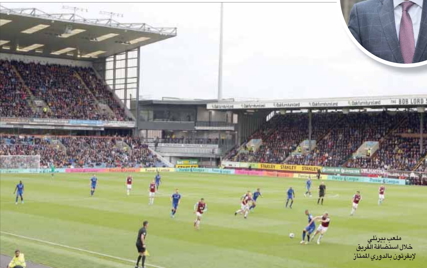
ملعب بيرنلي خلال استضافة الفريق لإيفرتون بالدوري الممتاز

طويلة. وتمثل إحدى الخطط على المدى المتوسط في بناء المزيد من المساحات المخصصة للمسؤولين التقنيين في ملعب الفريق، لأننا لا نملك ما يكفي لتلبية الطلب. تذاكر المباريات تتفقد قبل بداية كل مباراة. وربما يتعين علينا تجديد أو إعادة بناء بعض المدرجات، لأن بعضها أصبح قديماً للغاية الآن، لكننا سنقوم بهذا الأمر بصورة تدريجية. يجب أن يكون الوقت مناسباً لنا، لكننا سنقوم بذلك بشكل بطيء».