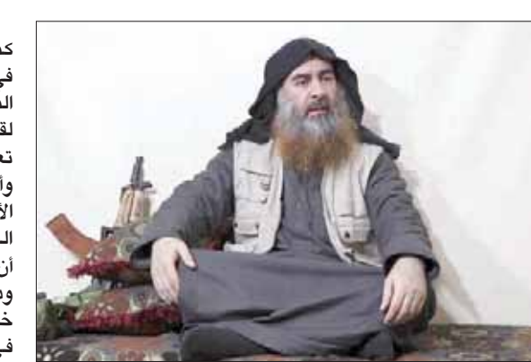
أبو بكر البغدادي (أب)

الأميركي، عن قتل البغدادي بأنه «يوم عظيم للولايات المتحدة والعالم»، وقال في تصريحات لبرنامج «واجه الصحافة» على قناة «إن بي سي»، صباح أمس (الأحد، إنه تابع العملية العسكرية مع الرئيس ترمب بقيادة المسؤولين، وإنه في الساعة السابعة وعشر دقائق مساء السبت الماضي تم إخبارهم «بنتيجة 100 في المائة» بأن هذه الغارة ليلة السبت، وهذا يوم عظيم لأمريكا والعالم، والرسالة من هذه العملية هي أنه إذا كنت منضماً إلى (داعش)، أو منضماً لاي جماعة إرهابية، فإننا سوف نطارده، وستعقبك بلا هوادة».