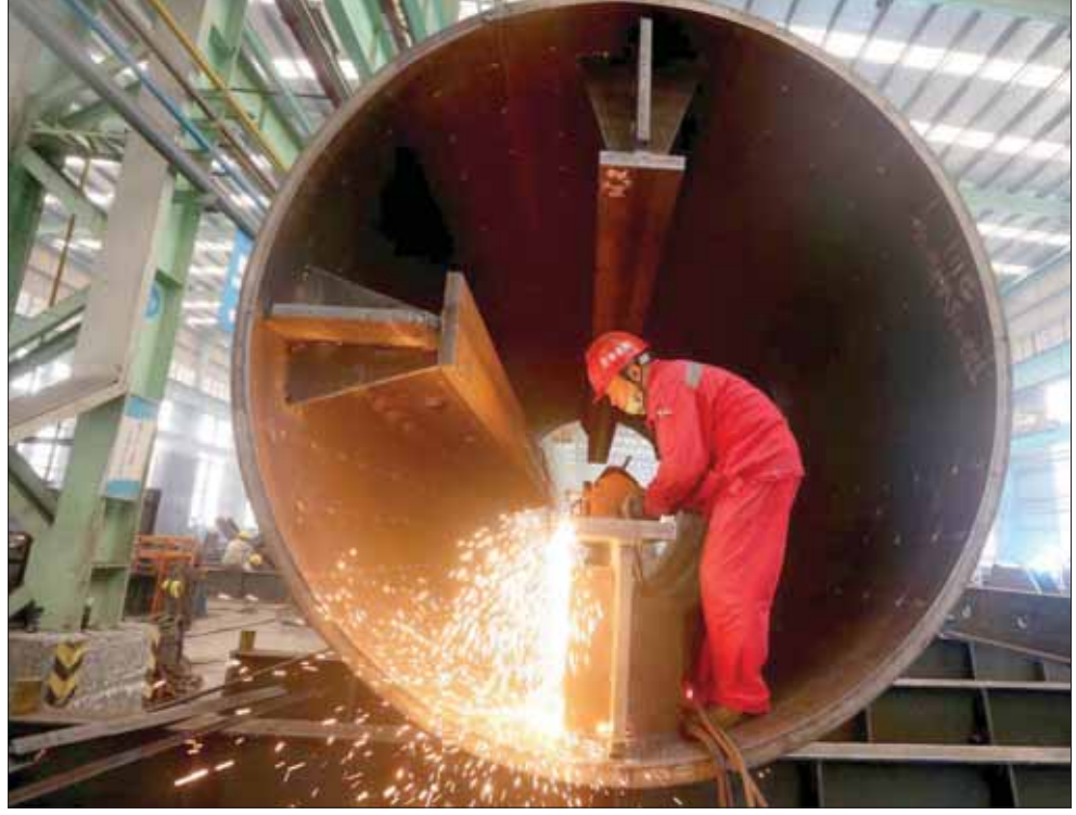
عامل في إحدى شركات الصلب في مقاطعة سيتشوان الصينية

إلى اتفاق إذا لم يوافق الاتحاد الأوروبي على تصديق المهلة النهائية حتى 31 يناير (كانون الثاني) 2020. وحذر رئيس الوزراء الأسباني من أنه إذا وافق الاتحاد الأوروبي على التصديق فإنه سيدفع لإجراء انتخابات عامة جديدة بدلاً من ذلك. وانخفض الجنيه الإسترليني من مستوى 1,30 أمام الدولار الأمريكي، واستمر في التراجع إلى أن بلغ أدنى سعر عند مستوى 1,2789 دولار للجنيه. وفي أعقاب اجتماع دولي لاجتماعات رؤساء الحكومات في لندن، ظهر الأريبعاء الماضي، صرح المسؤولون بتوصلهم إلى اتفاق عام لتصديق الموعد النهائي لانفصال المملكة المتحدة عن الاتحاد الأوروبي الذي كان من المقرر له أن يتم في 31 أكتوبر الجاري.