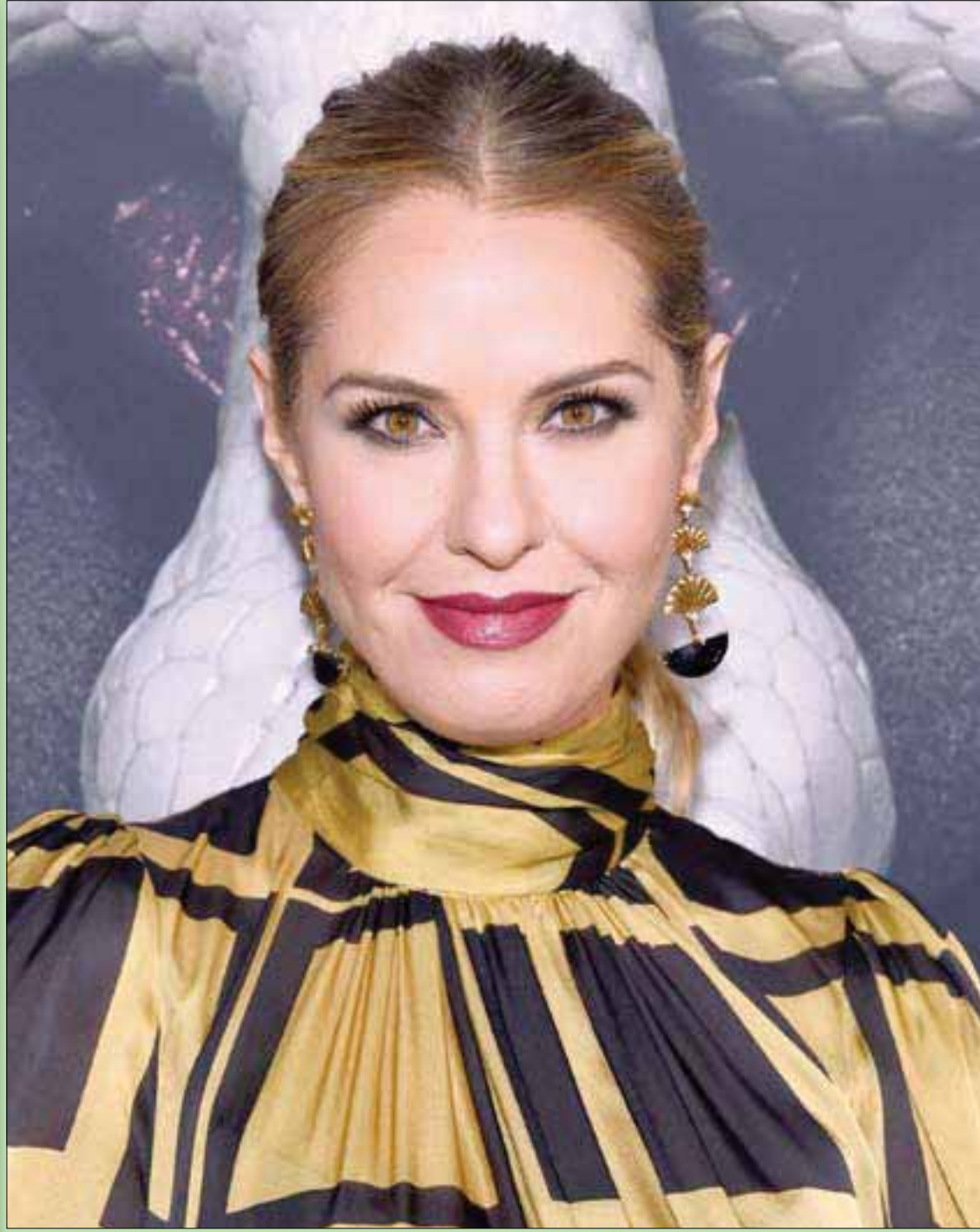
المثلة الأميركية ليزلي غروسمان تصل إلى الاحتفال بالحلقة 100 في مسلسل «فوكس» (قصة رعب أميركية) في هوليوود في لوس أنجلوس (أغب)