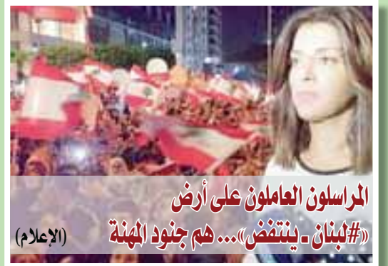
المراسلون العاملون على أرض «#لبنان - ينتفض»... هم جنود المهنة (الإعلام)