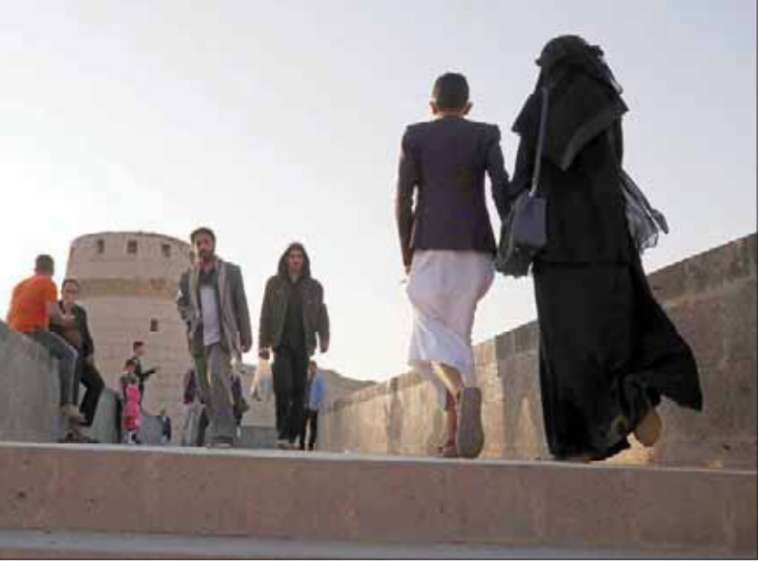
يمنيون يسيرون قرب المدينة القديمة بصنعاء (إ.ب.)

وأعزت الجماعة الحوثية إلى مجلس القضاء الخاضع لها ليعقد اجتماعاً، عقب قرار التجميد من حزب «المؤتمر» وأوردت مصادرهما الرسمية أن مجلس قضائهما أمر «بسرعة التحقيق مع المتسبب في إخراج المتهمين المذكورين، والرفع بنتائج التحقيق لاتخاذ الإجراءات الرادعة والكفيلة بعدم تكرار ذلك، ومحاسبة من تبين تقصيره وفقاً لما نص عليه قانون السلطة القضائية بشأن المحاسبة والتأديب». وتؤكد مصادر في حزب «المؤتمر» أن المئات من عناصره لا يزالون في سجون الجماعة الحوثية منذ مقتل صالح في ديسمبر (كانون الأول) 2017 وفشل انتفاضة في مواجهة الجماعة. إلى ذلك، لا تزال أغلى مقرات الحرب وممتلكاته ووسائل إعلامه وحساباته المصرفية خاضعة للميليشيات الحوثية، في صنعاء وغيرها من المحافظات الأخرى، وفق ما نقله المصادر نفسها.