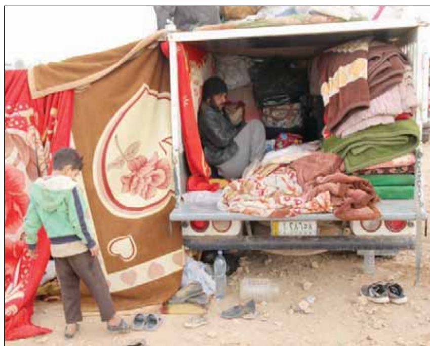
مخيم المحمودي في الطبقة شمال سوريا (الشرق الأوسط)

ويعدّ الشريط الحدودي الذي سيطرت عليه القوات التركية وفصائل سورية موالية من مدينة رأس العين شرقاً، إلى تل أبيب غرباً بطول 120 كيلومتراً ويعمم يصل في بعض الأماكن إلى 30 كيلومتراً، الأمر الذي دفع الإدارة الذاتية بشمال شرقي سوريا إلى نقل طاقني مخيم الطوحيتية وقسم من مخيم عين عيسى، إلى مخيم جديد أنشأته المفوضية السامية للأمم المتحدة لشؤون اللاجئين. ويقع مخيم «المحمودي» على بعد نحو 13 كيلومتراً شمالاً لحافظة الرقة شمال سوريا. مدير مخيم «المحمودي» وجه السرعة».