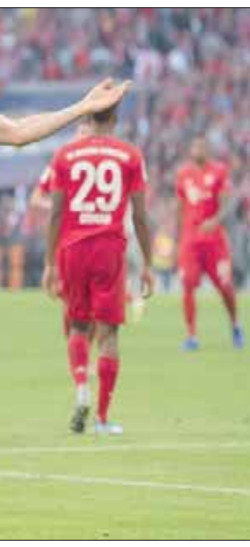
ليفاندوفسكي انفراد بالرقم القياسي لأكثر اللاعبين تسجيلاً للأهداف في المباريات المتتالية

وحتى الآن نجح ليفاندوفسكي في التسجيل في أول 13 مباراة في الموسم على مستوى جميع المسابقات بعد إحرازه 19 هدفاً وسيعادل الرقم القياسي لمولر إذا سجل في شباك بوخوم غداً الثلاثاء في كأس ألمانيا وكذلك خلال المباراة أمام إينتراخت فرانكفورت في البوندسليغا يوم السبت المقبل. وقال المهاجم البولندي إنشادة