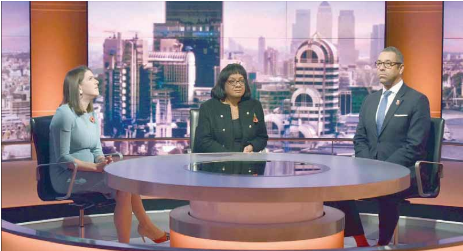
زعيم «الحزب الليبرالي الديمقراطي» جو سوينسون (يسار) ودايان أبوت من حزب العمال (وسط) وجيمس كليفي من حزب المحافظين خلال مشاركتهم في «برنامج أندرو مار» على قناة «بي بي سي» بلندن أمس

في 12 ديسمبر (كانون الأول) المقبل، اقترحها رئيس الوزراء، الخميس الماضي، للخروج من المازق. وجونسون الذي لا يملك أغلبية برلمانية لتحقيق وعده بتنفيذ «بريكست» في 31 أكتوبر (تشرين الأول) يحتاج إلى أغلبية الثلثين من النواب لإجراء انتخابات مبكرة، وبالتالي إلى دعم قسم من المعارضة.