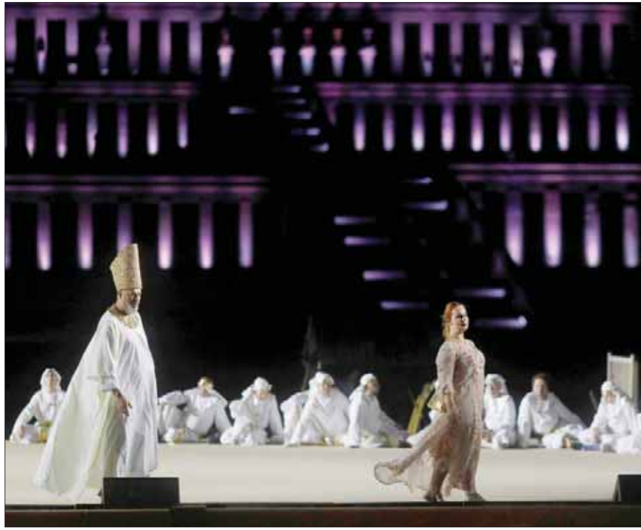
العرض الأول لـ «أوبرا عايدة» بعد 22 عاماً من الغياب

أبهر العرض الأول بعد 22 عاماً من الغياب، لـ «أوبرا عايدة» الجمهور العربي والأجنبي الذي احتشد مساء أول من أمس، في ساحة معبد الملكة حتشبسوت الأثري في البر الغربي بمدينة الأقصر (جنوب مصر)، وحرصت شخصيات عربية ومصرية مرموقة على حضور الحفل الذي قدمه أكثر من 80 عازفاً من أوركسترا أكاديمية (ليف) السيمفونية في أوكرانيا، بقيادة المايسترو الأوكرانية أوكسانا لينيف، أول امرأة تتراش أوبرا جران في النمسا، وبمشاركة 70 موسيقياً ضمن الكورال الوطني الأوكراني (دومكا)، وإخراج المخرج المسرحي الألماني مايكل شتورم.