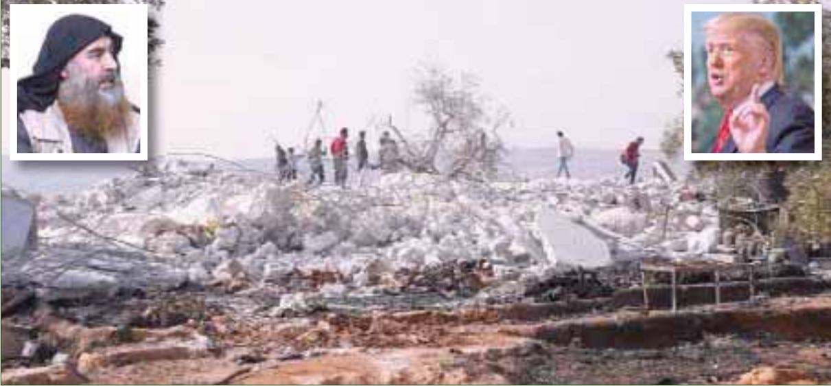
سوريون يعاينون أمس ركام المنزل الذي قتل فيه البغدادي... وفي الإطارين زعيم «داعش» وترمب معلناً قتله