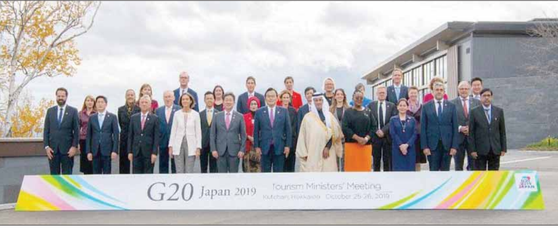
دبي، مساعد الزياتي

تراثية صناعية تعود لبدائيات القرن الماضي. وممن بدأها «موسم السعودية» الخاصة في المدن التي صاحبها إطلاق تاشيرة سياحية إلكترونية ترتبط بالمواسم السياحية فقط. شهد قطاع الإيواء في السعودية تصاعداً في نسبة الإشغال منذ بداية يناير (كانون الثاني) من العام الحالي بنسبة 58,3 في المائة إلى 74,4 في المائة في يونيو (حزيران) من العام الحالي، وفقاً لمركز «ماس» التابع للهيئة العامة للسياحة والتراث الوطني.