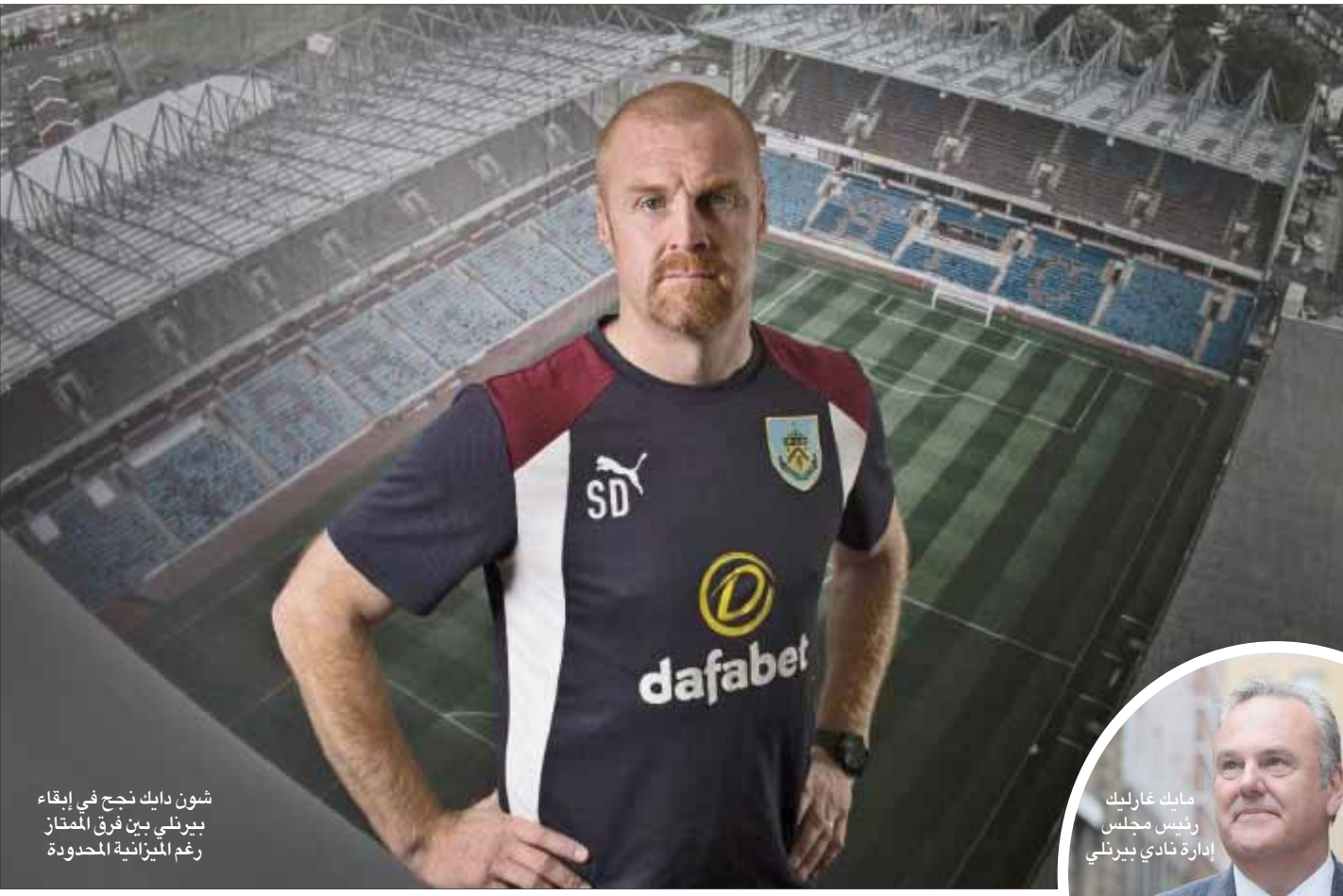
شون دايف نجح في إبقاء بيرنلي بين فرق الممتاز رغم الميزانية المحدودة