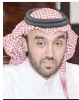
الأمير عبد العزيز الفيصل

منشورة في إحدى وسائل الإعلام خلال الموسم الرياضي الحالي 2018 - 2019. مع إرفاق رابط النشر الرسمي للمشاركة. يذكر أنه تم إطلاق هذه الجائزة خلال شهر مارس (آذار) الماضي ضمن مبادرات الاتحاد لتطوير الإعلام الرياضي، بهدف تشجيع ودعم الإعلاميين الرياضيين والارتقاء بالمواد الإعلامية الرياضية المقدمة، إضافة إلى صقل المواهب الإعلامية الشابة.