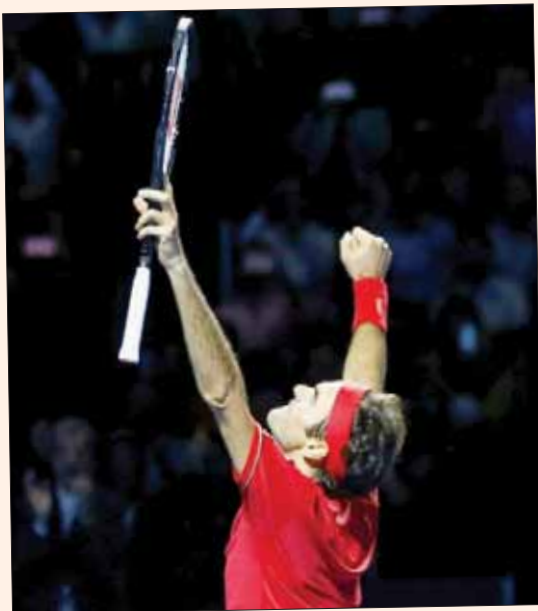
فيدرر يحتفل بفوزه ببطولة بازل

بازل (سويسرا) «الشرق الأوسط»، أحرز المصنف ثالثاً عالمياً السويسري روجر فيدرر للمرة العاشرة لقب دورة بازل للتنس الختامية في مسقطه، بفوزه في النهائي أمس على الأسترالي الشاب أليكس دي مينور 6 - 2 و 6 - 2.