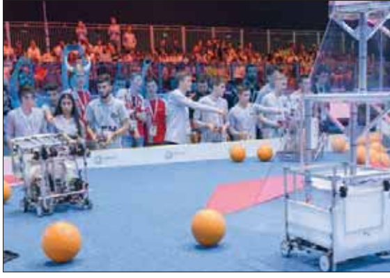
الوزير القرقاوي خلال حديثه مع المخترع وخبير التكنولوجيا ورائد الأعمال الأميركي دين كامين مؤسس البطولة

في تقديم ابتكارات وتوظيف الروبوتات والذكاء الاصطناعي في إيجاد حلول لتحديات عالمية، يعزز الأمل بمستقبل أفضل لقيادته الشباب بوعي وإصرار لتحسين حياة الناس والارتقاء بمجتمعاتهم. وأشار وزير شؤون مجلس الوزراء والمستقبل إلى أن زيادة الإمارات إقليمياً وعالمياً في مختلف المجالات المستقبلية، وموقعها في الخريطة العالمية تنكظت تلاقى بين الدول والسقارات، أسهمت في نجاح دبي باستضافة أكبر بطولة في تاريخ البطولة من حيث عدد الدول المشاركة منذ انطلاق البطولة رسمياً من الولايات المتحدة الأميركية للعالمية، عام 2017، بمشاركة 157 دولة. وقال إن الإقبال العالمي الواسع على المشاركة في البطولة يؤكد مكانة الإمارات ودورها المؤثر في جهود العالم لتوظيف التكنولوجيا في صناعة مستقبل أفضل، مشيراً إلى أن ما توفره دولة الإمارات من بيئة تنافسية محفزة على الإبداع والابتكار، وسعيها لاستقطاب المبتكرين وأصحاب المواهب في مختلف المجالات، جعل منها وجهة عالمية للعقول وأصحاب الأفكار الاستثنائية.