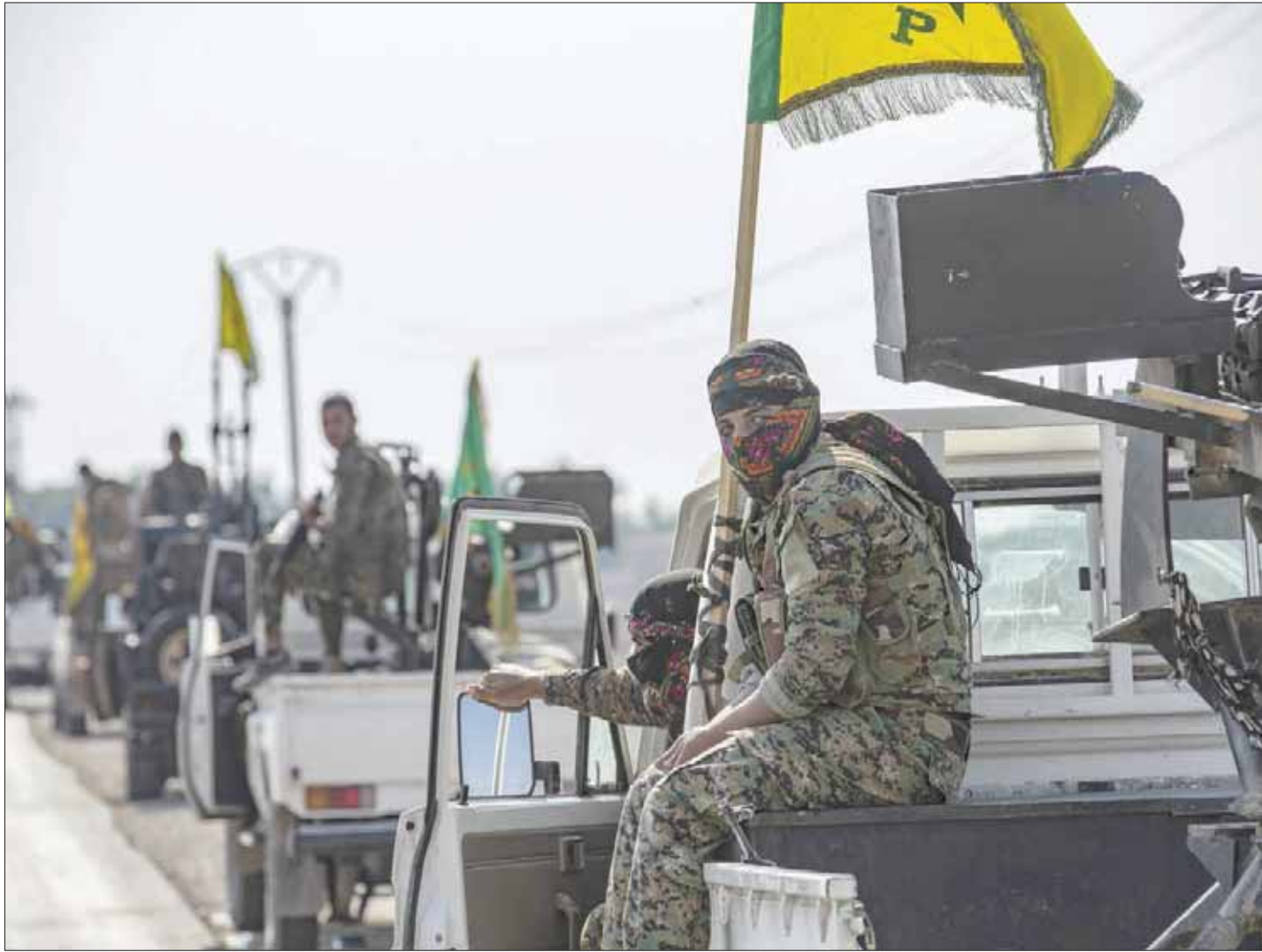
مقاتلون من «قوات سوريا الديمقراطية» ينسحبون من سنحج سعدون المحاذية للحدود التركية أمس (سوريا)

الوطني في مدينة الباب وريفها شرق حلب، عربات وسيارات دفع رباعي من تركيا، بهدف تعزيز الأمن في المنطقة الواقعة ضمن منطقة عملية «درع الفرات» التركية في شمال سوريا. وأكدت قوات الشرطة والأمن العام الوطني في الباب، على صفحتها الرسمية على موقع «فيسبوك»، أن تركيا زوّدت القيادة في مدينة الباب بشاحنات المدرعات والسيارات الحديثة، في إطار دعم وتعزيز الأمن في المنطقة. وتضمنت التعزيزات 15 سيارة بيك أب دفع رباعي، بالإضافة إلى 4 عربات مصفحة. وسبق أن قدمت ولاية غازي عنتاب التركية 7 سيارات حديثة لشرطة المرور في مدينة