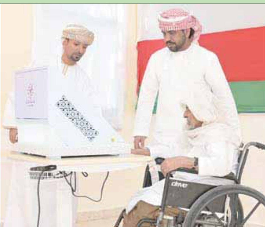
مسقط، مبرزا الخويدي

وقال يحيى بن ناصر الحراسي والي ولاية بوشر رئيس لجنة الانتخابات بالولاية لـ«الشرق الأوسط»: إن قانون الانتخاب يسمح للمرشحين بمراقبة سير عملية التصويت يوم الانتخاب، عبر وكلاء معتمدين، وقال: «لم نمنع أي مرشح من حقه في مراقبة عملية