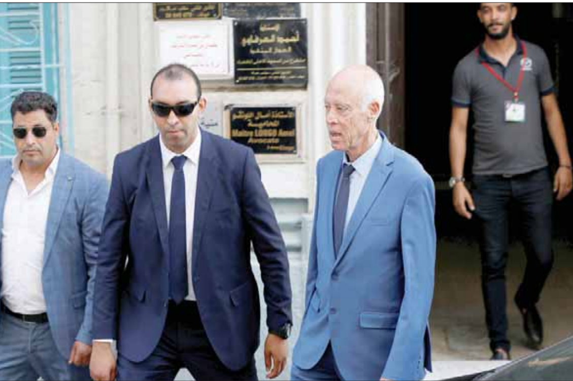
المرشح الرئاسي قيس سعيد خلال قيامه بحملته الانتخابية وسط العاصمة التونسية أمس

كما سجلت هذه الشخصيات الوطنية والحقوقية احتراماً جدياً تجاه الغرض الذي يحف بمواقف المرشح قيس سعيد، التي تتطلب إجابات واضحة تبعد مخاوف شرائح كبيرة من المواطنين فيما يخص النظام السياسي غير واضح المعالم، الذي يربد جر البلاد إلى اعتمادها».