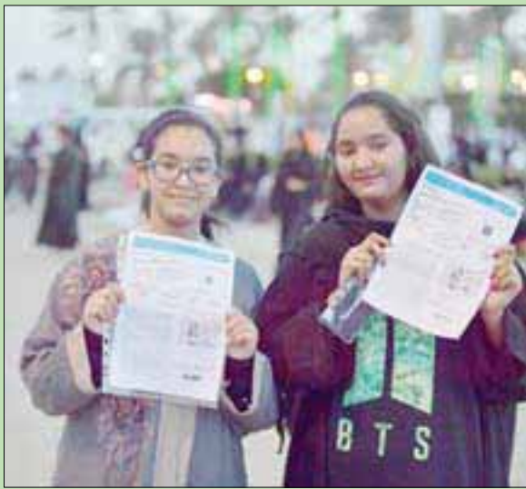
صورتان من ملعب الملك فهد من الفعاليات الترفيهية لموسم الرياض