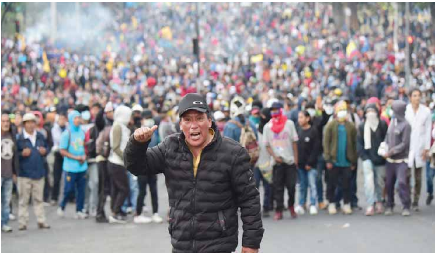
مديرية، شوقي الرئيس

في مؤشر آخر على التصعيد الذي قرّر المتظاهرون المضي فيه حتى النهاية، قال أحد قادة الاحتجاجات في الإكوادور: «لن نتفاوض على دماء إخواننا... لن نتفاوض مع هذه الحكومة الفاشلة والكاذبة». بهذه التصريحات ردّ أحد زعماء السكان الأصليين على العرض الذي قدمه رئيس الجمهورية لينين مورينو للتفاوض مع المتظاهرين الذين يخرجون في احتجاجات حاشدة منذ أسبوع، ضد التدابير الأخيرة التي اتخذتها الحكومة، وأدت إلى ارتفاع غير مسبوق في أسعار معظم المواد الأولية.