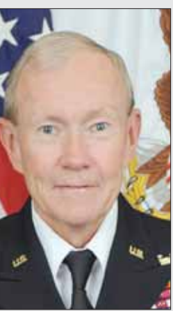
الجنرال مارتن ديمبسي

وشغل منصب الرئيس الخامس عشر لرؤساء الأركان المشتركة من 2001 حتى 2005. وبهذه الصفة، شغل منصب المستشار العسكري للرئيس جورج بوش، ووزير الدفاع ومجلس الأمن القومي خلال المراحل الأولى من الحرب على الإرهاب، بما في ذلك تخطيط وتنفيذ غزو العراق عام 2003. الجنرال مايكل مولن (من مواليد 4 أكتوبر لتشرين الأول 1946)، أميرال متقاعد من سلاح البحرية الأمريكية. شغل منصب الرئيس السابع عشر لرؤساء الأركان المشتركة من 2007 حتى 2011. وكان الضابط الثالث فقط في تاريخ البحرية الذي يجري تعيينه في 4 مهام مختلفة من رتبة الأربع نجوم، إذ كان أيضاً قائداً للقوات البحرية الأمريكية في أفغانستان، كما قاد عدة وحدات، بما في ذلك فوج البحرية الخامس إبان غزو العراق عام 2003. الجنرال جوزيف دانفورد (من مواليد 8 ديسمبر كانون الأول 1955)، الرئيس التاسع عشر لرؤساء الأركان المشتركة من 2015 حتى 2019. وكان الرئيس 36 للقوات مشاة البحرية (المارينز)، وقائداً للقوة الدولية والأميركية في أفغانستان، كما قاد عدة وحدات، بما في ذلك فوج البحرية الخامس إبان غزو العراق عام 2003.