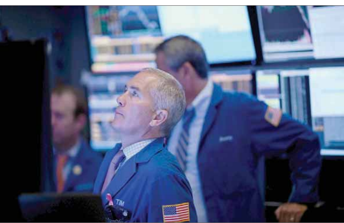
اضطر الاحتياطي الفيدرالي في 17 سبتمبر لضخ 53 مليار دولار في الأسواق لخفض فوائده «الريبو» التي صدعت فجأة

ولزيادة حيرة المتابعين، أكد تقرير لوكالة «بلومبرغ» أن احتمالات خفض الفائدة تصل نسبتها هذه الأيام إلى 80 في المائة، علماً بأن القرار منظر في 30 أكتوبر الحالي، وتلك الحيرة ناتجة من تناقض ما في التوقعات: سياسة تحفيزية في ضح سيولة في الأسواق، مقابل سياسة تشددي في خفض الفائدة؛