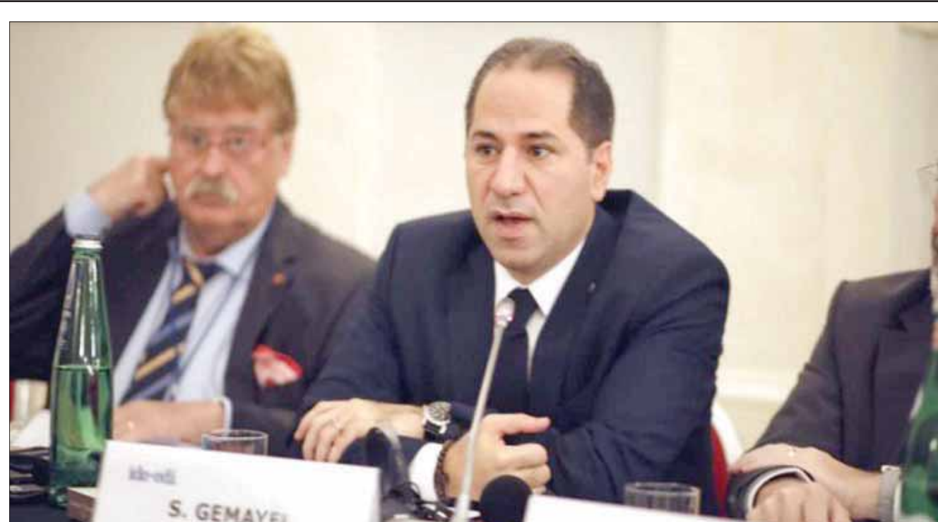
النائب سامي الجميل خلال مداخلة أمام اتحاد أحزاب الوسط في روما أمس (موقع حزب الكتائب)