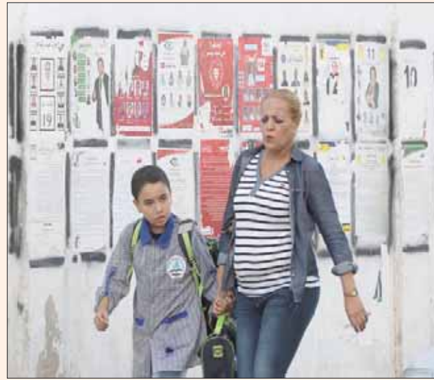
تونسية وابنها يسيران في شارع مليئ بالعدايات للانتخابات البرلمانية التي جرت مؤخراً (إ.ب.أ)

صوتاً عن كل مقعد. ● ائتلاف الكرامة 21 مقعداً بمعدل 8992 صوتاً عن كل مقعد. ● حركة النهضة حصلت على مقاعد في كل الدوائر وتصوتت الترتيب من حيث عدد الأصوات في 25 دائرة، وحصلت على نسبة تجاوزت 40 في المائة في دائرة واحدة والـ30 في المائة في ثلاث دوائر وتجاوزت الـ20 في المائة في ست دوائر.