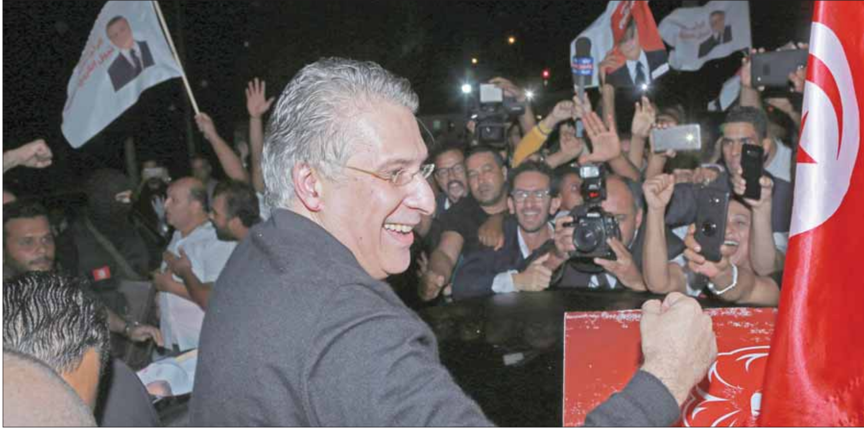
رئيس حكومة مستقل

لكن، هل يمكن أن تستمر المزيادات الكلامية والسياسية طويلاً... أم ستفرض مشاورات تشكيل الحكومة منطق «براغماتية جديدة» ومنطق «ما بعد الحملات الانتخابية»؟ تصريحات معظم السياسيين المعنيين بالمشاركة في الحكومة المقبلة ورئاسة البرلمان الجديد ولجانته المختصة تؤكد أن «شعارات القطيعة» التي برزت أثناء الحملة الانتخابية مرشحة لأن تختفي، بما في ذلك ما يتعلق بـ«القطيعة مع رموز المنظومة القديمة وحزب الباجي قائد السبسي الذي تصدر مؤسسات الدولة خلال