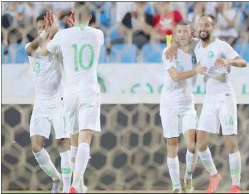
لاعبو المنتخب السعودي يحتفلون بأحد أهدافهم في شبك سنغافورة

مع المنتخب اليمني بهدف لكل منهما. وادى المنتخب السعودي مساء أمس، تدريبه الأخير في القصيم، حيث يتوقع أن يكون اللاعب علي البلبي في كامل جاهزيته الفنية للمباراة المقبلة ضد المنتخب الفلسطيني، بعد أن غاب عن المباراة الماضية نتيجة عدم انضمامه إلا في اليوم الأخير للتدريبات لظروفه الأسرية. من جانبه، قال مدرب المنتخب السعودي هيرفي رينارد إن الأخضر أهدر كثيراً من الفرص السانحة للتسجيل في المباراة الماضية التي كان من الممكن أن تجعل النتيجة أكثر من 3 أهداف. وبين أنه سيعمل في الفترة المقبلة على عدم تكرار الفرص السانحة للتسجيل بالشكل الذي تم في المباراة الماضية، لأن المباريات تزداد صعوبة وقوة كلما تقدمنا في المشوار. وأكد رينارد أنهم دخلوا