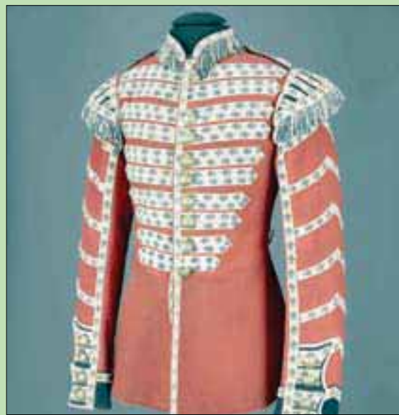
سترة لضابط فرنسي من القرن التاسع عشر