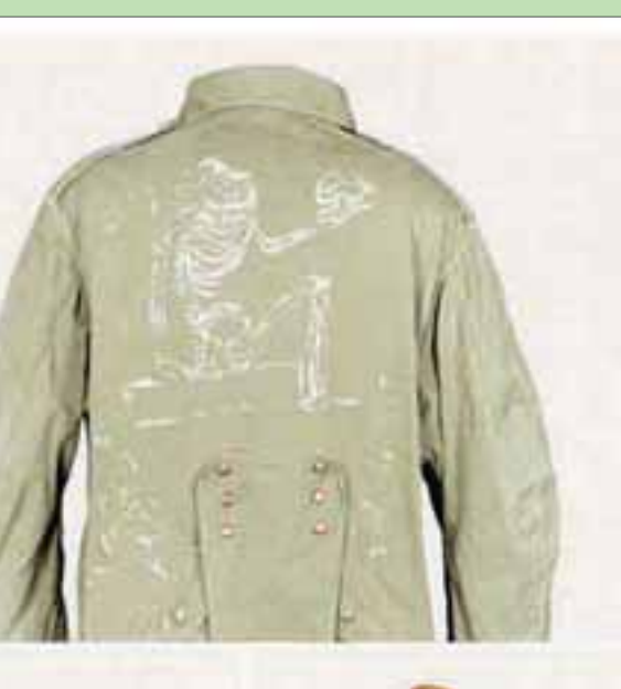
الشباب يستلهمون الجنود في ثيابهم

باريس، «الشرق الأوسط» في اللغة الشبابية، توصف المرأة بالغة الجمال في فرنسا بأنها «صاروخ». وتحت عنوان «صواريخ الأناقة»، يستضيف متحف الجيش في باريس معرضاً عن تطور تصاميم ثياب العسكر منذ العصور الوسطى حتى اليوم. ويشتمل المعرض على بيزات وقبعات وسترات ارتداها فرسان القوات الإمبراطورية ثم الجمهورية في فترات مختلفة من التاريخ. كما يعرض تأثيرات تلك الموضة الحربية على أزياء الشباب اليوم. يكتشف زائر المعرض أنّ مصممين من المشاهير كانت لهم مساهمة في رسم الموضة العسكرية. ومن هؤلاء البلجيكي دريس فان نوتن ومواطنه ألف سيمونز والفرنسي جان بول غوتيه. لقد صمموا بيزات في منتهى الجمال لجنود وضباط من مراتب وقرق مختلفة. وتتبع الثياب، في العادة، أغشية الرأس المناسبة لها والدروع وجرابات السلاح. وهناك، بالإضافة إلى البيزات الراقية التي ترتدى في المناسبات والاستعراضات، معاطف واقية من المطر ومظلات وأحذية ذات أعناق طويلة. يخبرنا دليل المعرض أنّ أزياء العسكر كانت تتطور حسب قوة الجيوش التي ينتمون لها. ففي عصور ازدهار الإمبراطورية الفرنسية وانتصارات نابليون بونابرت كانت قيادة الضباط تتميز بالثراء والأقمشة النخيلة. وحتى بعد حلول النظام الجمهوري، لم يتخل العسكريون عن ميلهم للبدلات الأنيقة والمظهر اللافت للنظر. وهناك في المعرض أكثر من 200 زي تعكس تعلق منتسبي الجيش الفرنسي بالأناقة والطلاقة المميزة والجاذبة. ويعود بعض تلك الأزياء إلى القرن السادس