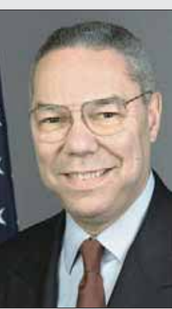
الجنرال كولن باول

خلال حرب الخليج. وهو أول أميركي جامايكي يتولى هذا المنصب، وشغل منصب مستشار الأمن القومي من عام 1987 حتى 1989، ثم عين وزيراً للخارجية في عهد الرئيس جورج بوش الابن الرابع نجوم في سلاح الجو.