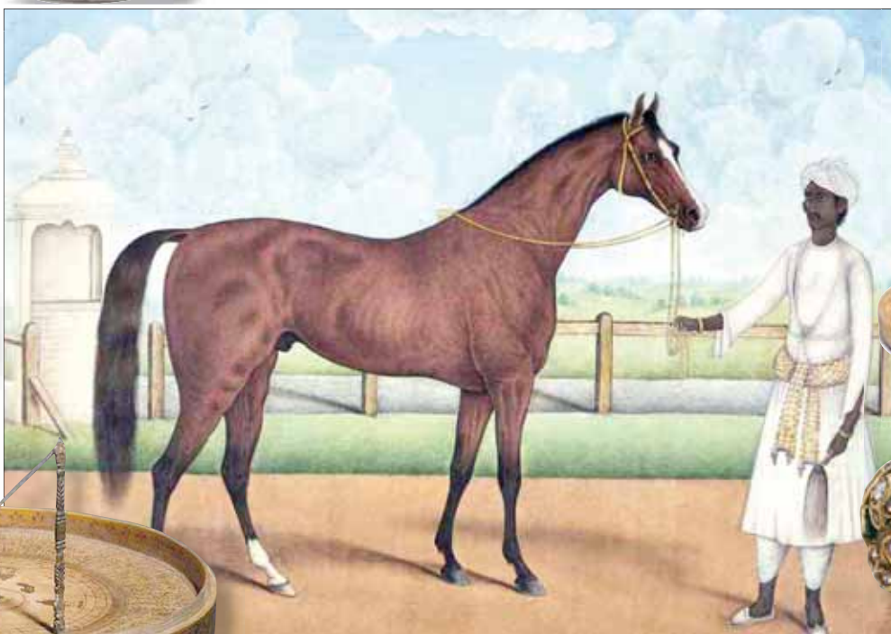
لوحة تمثل حصاناً ومدربه من الهند عام 1840

بالمينا الأخضر صنع في شمال الهند، عام 1900. ومن القطع التي ترتبط هنا أمامنا الآن مصنوعة من الذهب المطعم بقطع الماس والزمرد. أما السلطانية، فيمكننا تخيلها وهي ترتدي أحد العقود الفخمة هنا مثل عقد «مانغا مالاي»، المصنوع من الذهب والماس والياقوت، الذي صنع في جنوب الهند. تمتاز قلادة «مانغا مالاي»، وتعني «قلادة المانغو»، بتفرداها وانتظام القطع الذهبية التي شكّلت على شكل ثمرة المانغو، فإن ثمار المانغو الهندوسية، فإن ثمار المانغو الكريمة والمينا الملونة تحتل جانباً كبيراً من مزاد هذا الموسم، إذ تضم مجموعتين من المجوهرات الاستثنائية. تمتد أمامنا القطع المختلفة داخل علب من المخمل، ويبدو الأمر وكأننا قد فتحنا أحد صناديق الكنوز من حكايات «الف ليلة وليلة»، وتبدو أول قطعة تقع في يدينا وكأنها تجسيد لإحدى الحكايات التي يرتدي فيها السلطان أجمل ملابسه، وتزين عمامته