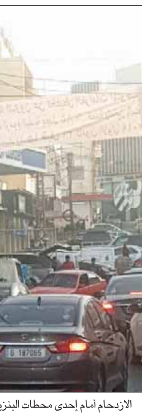
الازدحام أمام إحدى محطات البنزين أمس

مستوردي المحروقات بالزام الموزعين بدفع ثمن الكميات التي يبيعونها بالدولار، رغم أن تسعيرة الحكومة للمحروقات بالليرة اللبنانية، ويشترى الناس المحروقات بالليرة، وإنفاقهم أزمة توفر العملة الصعبة بالسوق، وارتفاع سعر الصرف غير الرسمي أكثر من سعره الرسمي، تقلص حجم انتشار الدولار بالسوق، وبدأ مستوردو السلع الأساسية مثل الطحين والأدوية والمحروقات يشعرون بالأزمة. وتدخل مصرف لبنان من خلال تعميم إصداره الأسبوع الماضي يطلب فيه من المصارف فتح اعتماد لمستوردي السلع الأساسية بالليرة، وصرف الدولارات من مصرف لبنان بالسعر الرسمي، لكن المستوردين يتهمون الدولة بالتقاعس عن تنفيذ هذا الالتزام. وبموازاة تحذير أصحاب