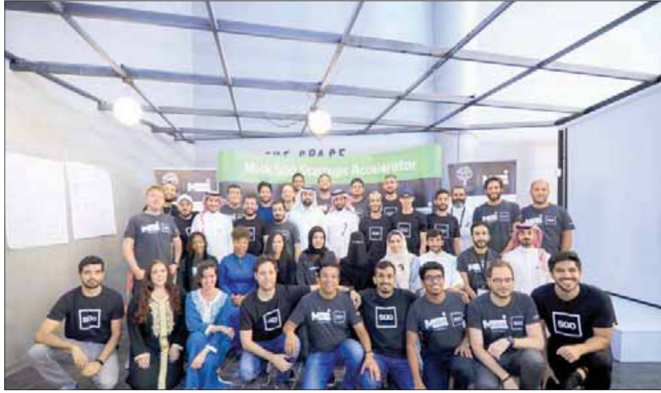
يعمل البرنامج خلال فترة الأشهر الثلاثة على دعم الأفكار الخلاقة