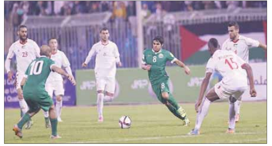
من مواجهة سابقة جمعت المنتخب السعودي ونظيره الفلسطيني

أكد اللواء جبريل الرجوب، رئيس الاتحاد الفلسطيني لكرة القدم، أن