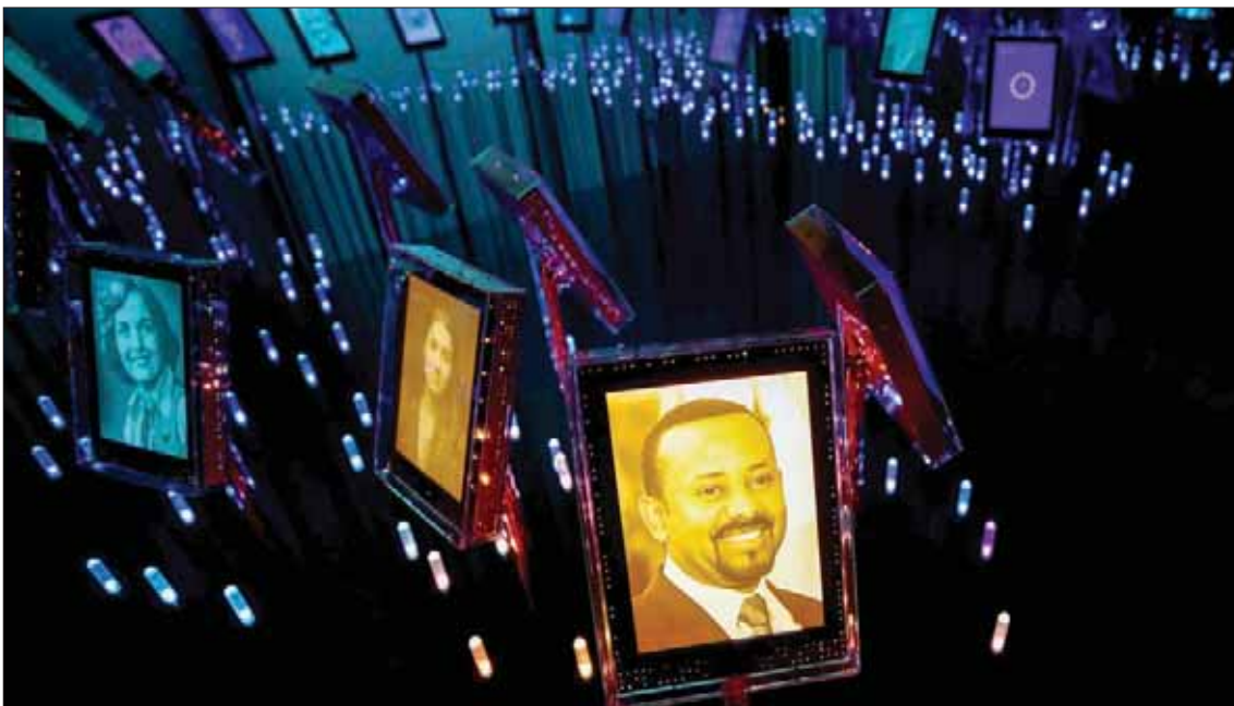
صورة لأبي أحمد في مركز نوبل في أوسلو أمس

ويأتي منح الجائزة في وقت مناسب لأبي أحمد (43 عاماً) الذي يواجه تصاعداً متديراً للقلق للعنف بين الأقليات العرقية في بلده التي يُفترض أن تشهد انتخابات تشريعية في مايو (أيار) 2020، وأكد رئيس الوزراء الإثيوبي أن منصفه الانتخابية «يشرفه» و«يسعد»، مرجحاً «بجائزة مُنحت إلى أفريقيا». وقالت لجنة لجائزة أنها «تأمل في أن تعزز جائزة نوبل للسلام رئيس الوزراء الإثيوبي أبي في عمله المهم من أجل