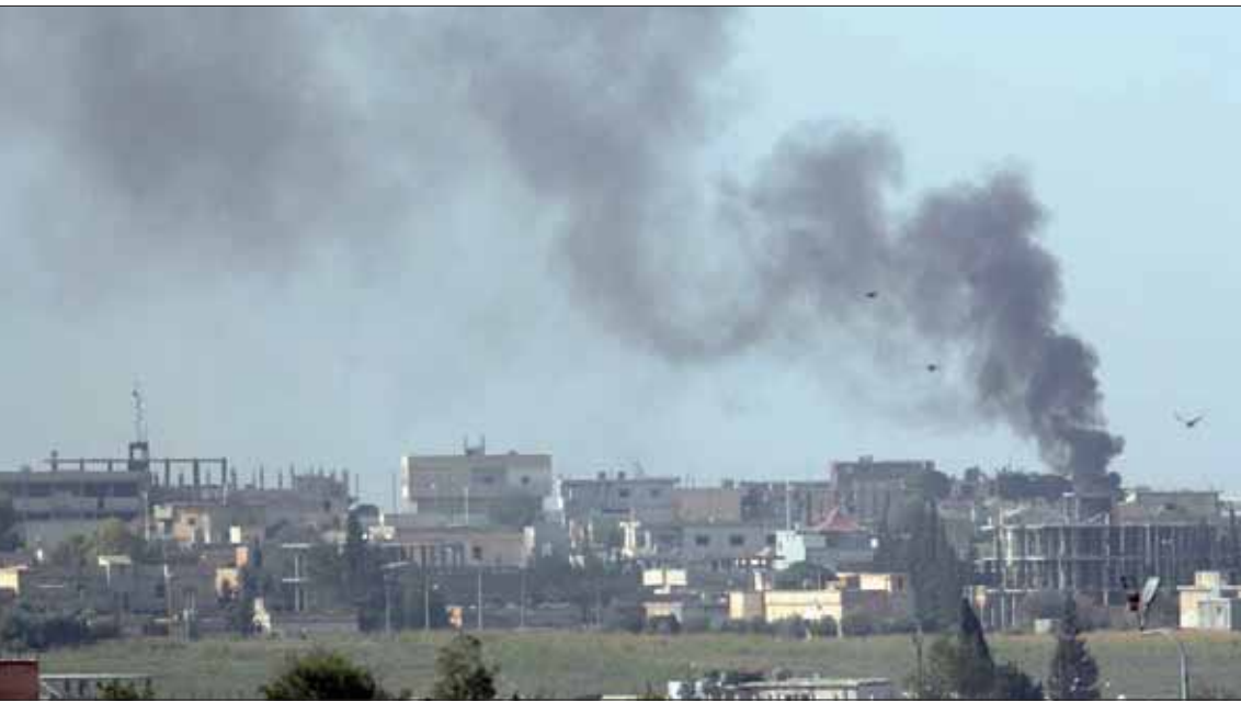
دخان يتصاعد من تل أبيض بعد قصف تركي أمس

وأضافا أن سيطرة تركيا على تلك المنطقة ووصولها إلى خط الطريق السريع مع العراق، يعني أنها ستكون المسؤولة مباشرة عن الأمن والأشياء أخرى مختلفة، فضلاً عن إعادة