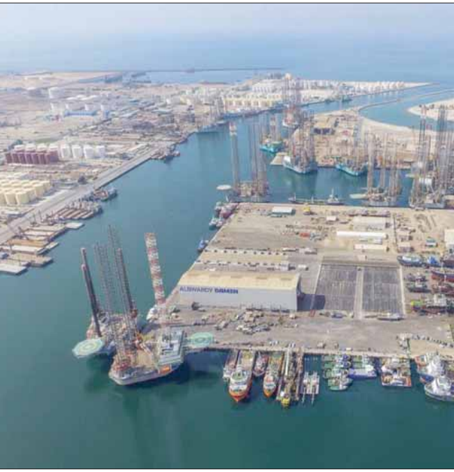
المنطقة الحرة في حميرة الشارقة (الشرق الأوسط)

وقال: «أصبحت مناطقنا الحرة مدناً متكاملة من الخدمات والتسهيلات التي توفر البيئة الحاضنة للشركات. والتركيز على تطوير نشاطاتهم وعملياتهم خارج الحدود، وإلى أسواق جديدة، قمتنا بزيادة المساحات التجارية، ووفرنا خدمات إضافية لم يصبح بعدها المستثمر بحاجة لمغادرة المنطقة الحرة بتاتاً، فكل ما يحتاج إليه بات متوفراً، من خدمات حكومية ومصرفية ومطاعم ومساحن، وغيرها من الخدمات اليومية الضرورية». وزاد: «بلغت قيمة استثمارنا في تطوير البنية التحتية في كل من المنطقة الحرة لمطار الشارقة الدولي والمنطقة الحرة للمحيرة 4,2 مليار درهم