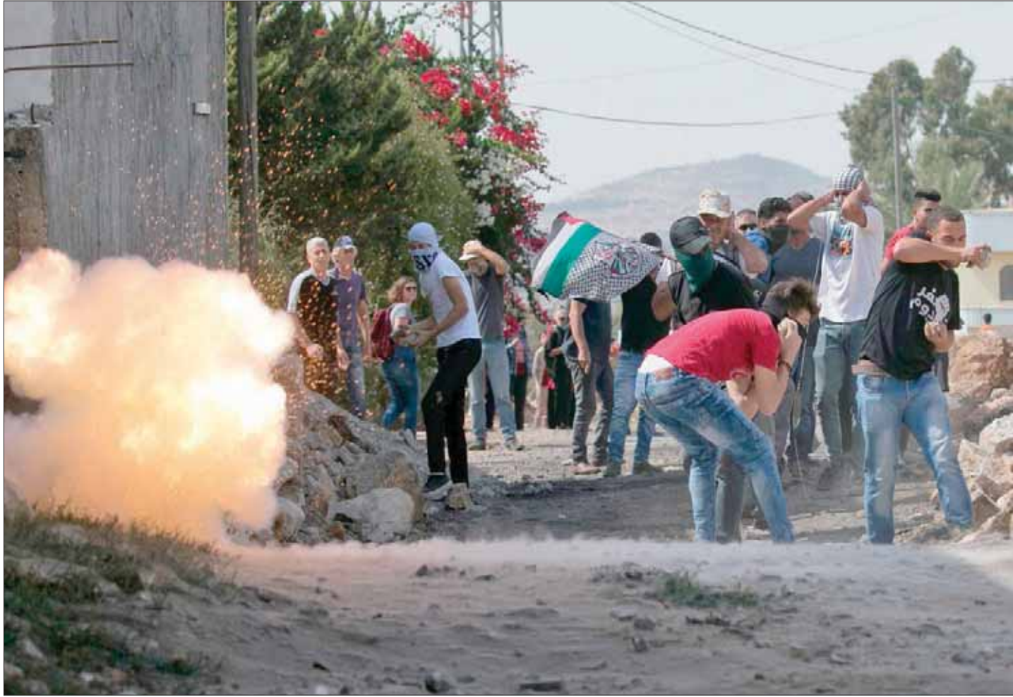
جانب من مسيرة أمس في بلدة كفر قدوم في الضفة الغربية

الجمعة. وقال: «هذا الأمر قد أعمال العنف التي تشهدها هذه المظاهرات على الأطفال. فممنذ يوم 30 مارس (آذار) 2018، قُتل 40 طفلاً فلسطينياً وأصيب 1521 طفلاً آخر بجروح بالذخيرة الحية على يد القوات الإسرائيلية. وإنني أدعو مرة أخرى إسرائيل إلى الامتناع عن استخدام القوة المفرطة، بما تشمله من استخدام الذخيرة الحية، رداً على تلك المظاهرات، واذكرها بمسؤوليتها عن ضمان سلامة الأطفال ورفاههم». كما أعرب المسؤول الأمني عن قلقه من قيام حركة «حماس» بإطلاق شعار «أطفالنا الشهداء»، على مسيرات العودة، أمس