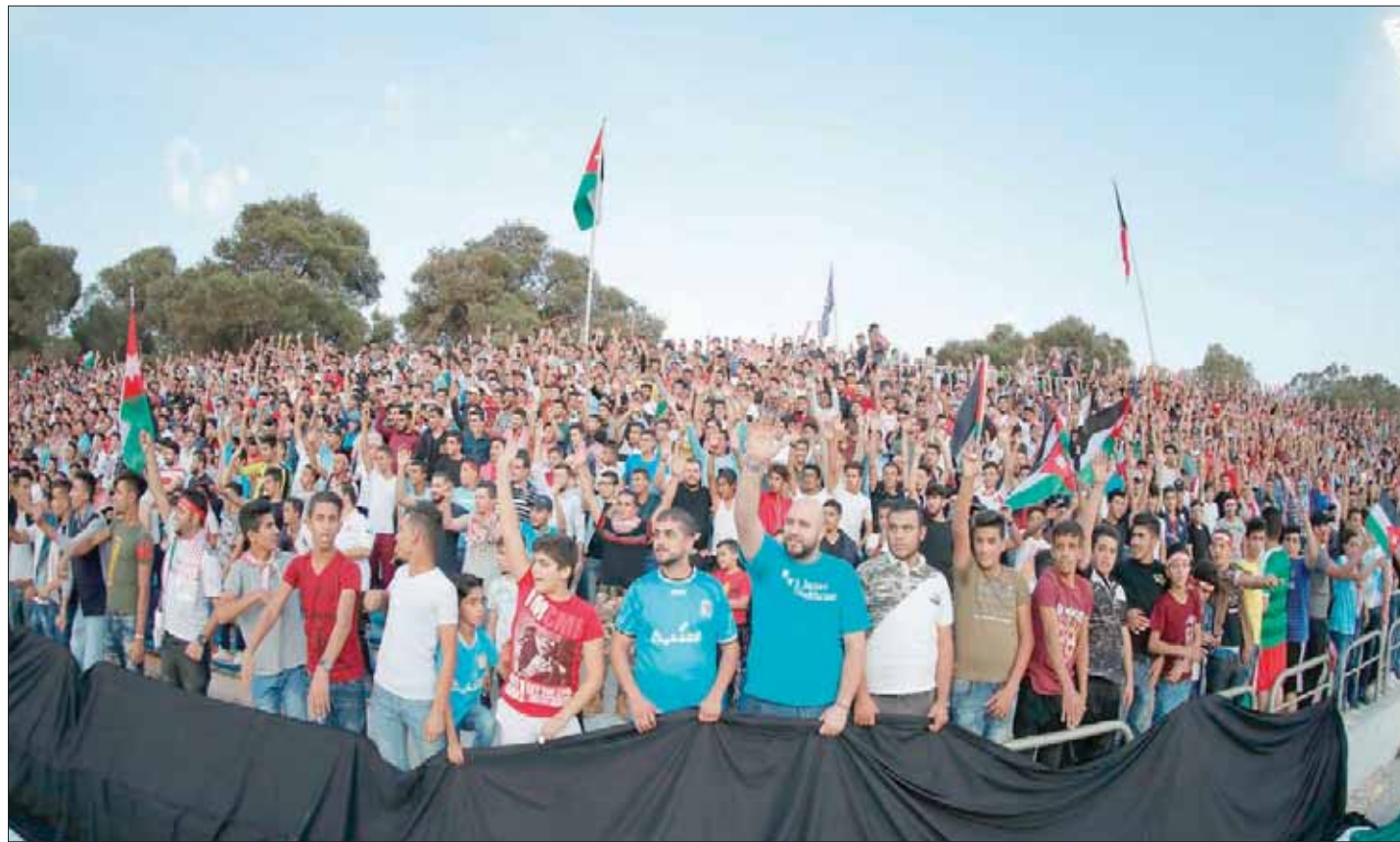
جمامير أردنية حضرت مساندة منتخبها في مباراة الكويت

كادت هتافات من بعض الجماهير الأردنية، تتسبب في أزمة سياسية بين عمان والكويت، وذلك خلال المباراة التي جمعت المنتخبين، أول من أمس، في تصفيات آسيا الموندالية، وذلك بعد إطلاقهم لهتافات للرئيس العراقي السابق صدام حسين. وقيل أن تبدأ المباراة بين المنتخبين الأردني والكويتي، تسببت هتافات بعض من الجمهور الأردني في حملة استنكار واسعة على منصات التواصل الاجتماعي، رفضت تصرفات الجمهور «الذي تجاوز التقاليد الرياضية والروح العالية بين الشقيقتين».