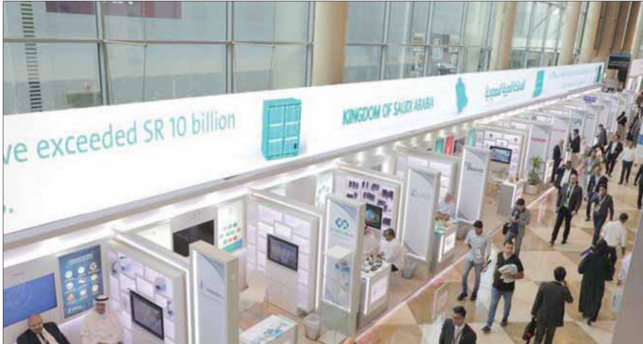
الشركات السعودية تسعى للبحث عن أسواق خارجية وزيادة فرص التصدير (الشرق الأوسط)

ووفقاً لـ«منشآت»، سيسهم نظام الامتياز التجاري بتوسيع أعمال المنشآت ذات العلامة التجارية المعروفة دون الحاجة إلى إنفاق أموال من الشركة الأم على التوسع بالفروع،