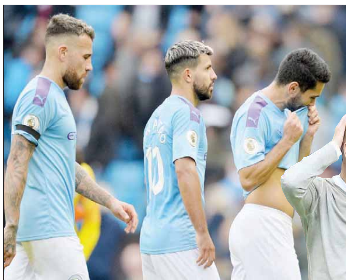
لاعبو مانشستر سيتي بعد الهزيمة أمام وولفرهامبتون

11 مباراة للفريق في الدوري. وفي ذلك الوقت، كان يُنظر إلى هذا الأمر على أنه وداغ مناسب لقائد الفريق الذي دافع عن ألوانه لسنوات طويلة، والذي كان يساعد زملائه كثيراً بفضل هدونه وخبراته الكبيرة. ورغم أن الحال ربما كان كذلك بالفعل، فإن هناك سبباً آخر جعل غوارديولا يدفع بوكوماني، وهو أنه لا يقف في جون ستونز وأوتاميندي. كما أن إصابة إيميريك لابورت، وبدرجة أقل جون ستونز، قد أثبتت صعوبة إيجاد بديل لوكوماني. وقد ظهر أوتاميندي بشكل سيء للغاية في المباريات الماضية، سواء بسبب شعوره بعدم الراحة والكثرة بين قدميه أو بسبب عدم قدرته على بناء الهجمات من الخلف للأمام. وقد بدأ من الواضح أنه غير قادر على القيام بالأدوار الدفاعية المطلوبة، وأنه يفترق للثقة، وهو ما ظهر للجميع في تدخله واندفاعه بشكل سيء على راؤول خيمينيز في الهجمة التي أدت إلى استقبال مانشستر سيتي للهدف الأول أمام وولفرهامبتون واندررز. لكن هذا كله ما هو إلا مجرد جزء صغير من المشكلة الأكبر التي يعاني منها الفريق في الخط الخلفي، إذ إن الإصابات التي يعاني منها الفريق قد جعلت غوارديولا يدفع بكثير من اللاعبين في مركز الظهير الأيسر، خلافاً لمراكزهم الأصلية، إما عن طريق المدافعين (لايورت)، أو لاعبي خط الوسط (فابيان ديلف وأوكساندر زينشيتكو)، أو عن طريق لاعب يلعب في الأساس ناحية اليمين (جواو كانسيلو). ومرة أخرى،