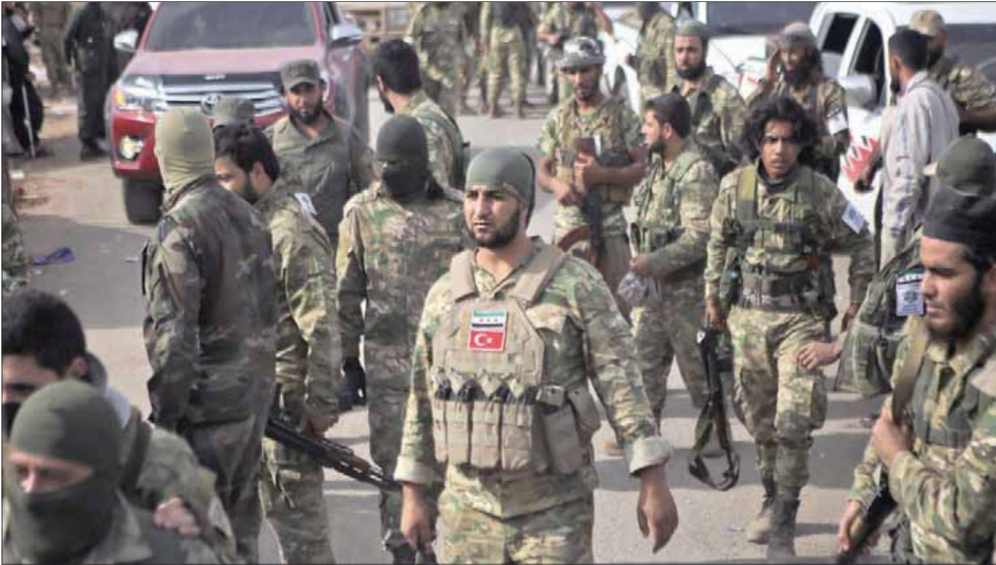
مقاتلون سوريون تدعمهم تركيا خلال المعارك شرق الفرات أمس

من جهة أخرى، عبر رئيس الاتحاد الأوروبي دونالد توسك، عن رفض التكتل الموحد «إبتران» الرئيس التركي رجب طيب أردوغان بشأن اللاجئين. وكان الرئيس التركي قد هدد الأوروبيين بإغراق بلادهم بملايين اللاجئين في حال اعتبروا عملياته العسكرية في أراضي دولة مجاورة. وكان الأوروبيون قد طالبوا أردوغان بوقف العملية فوراً. وجاءت تصريحات توسك، خلال زيارة له أمس الجمعة للعاصمة القبرصية تمهيداً للقمة الأوروبية نهاية الأسبوع المقبل، حيث التقى الرئيس نيكوس أناستاسياديس، حيث قال: «لا نقبل أبداً أن يتم استخدام اللاجئين كسلاح ومادة لإبتران».