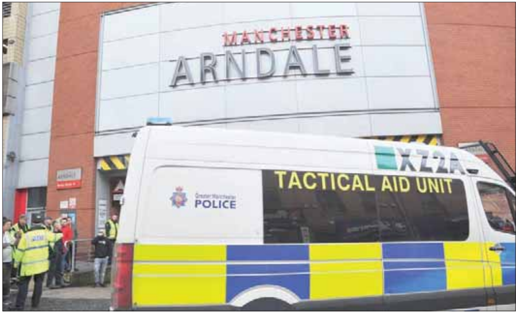
رجال شرطة وأسعاف أمام مركز آرنديل للتسوق في مانشستر بعد حادث الطعن أمس

أفراد الشرطة يستخدمون مسدسا صاعقا خلال القبض على الرجل. وأفادت وسائل إعلام وشهود عيان أن مركز آرنديل تم إخلاؤه من زواره وموظفيه بحضور أعداد كبيرة من رجال الشرطة والأسعاف. وقال مسؤول في أحد المحال التجارية ضمن المركز: «طلب موظفو الأمن من جميع المانعين إغلاق أبواب المتاجر وإبعاد المتسوقين إلى الجهة الداخلية من المحلات». وتناقل رواد وسائل التواصل الاجتماعي الخبر مع مقاطع فيديو أحدها تصور توقيف الشرطة للمشتبه بقيامه بالطعن. وكانت المدينة قد شهدت أدنى هجوم نفذه متشددون في بريطانيا في السنوات الأخيرة عندما قتل مهاجم انتحاري 22 شخصا في مايو (أيار) 2017 في نهاية حفل للمغنية أريانا جراندي في مانشستر أرينا في موقع ليس بعيد عن مركز آرنديل.