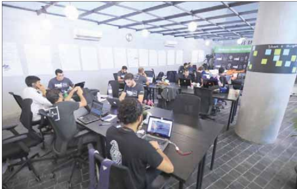
الدفعة الثانية بعد أن التحق بـ «المسرعة» في الدفعة الأولى 19 مشروعاً ناشئاً

التحقت 20 شركة ناشئة في السعودية ومنطقة الشرق الأوسط وشمال أفريقيا بمشروع «مسرعة مسك 500»، الذي ينظمه مركز المبادرات في مؤسسة محمد بن سلمان الخيرية «مسك الخيرية» ممثلاً في مبادرة مسك الابتكار، حيث تم إطلاق أعمال المسرعة يوم أمس، في مدينة الرياض، وتستمر لمدة ثلاثة أشهر، وذلك للمساهمة في تأهيل قيادات المشاريع الناشئة بما يضمن تنمية مشاريعهم ومساعدتهم على التحول إلى شركات ناجحة.