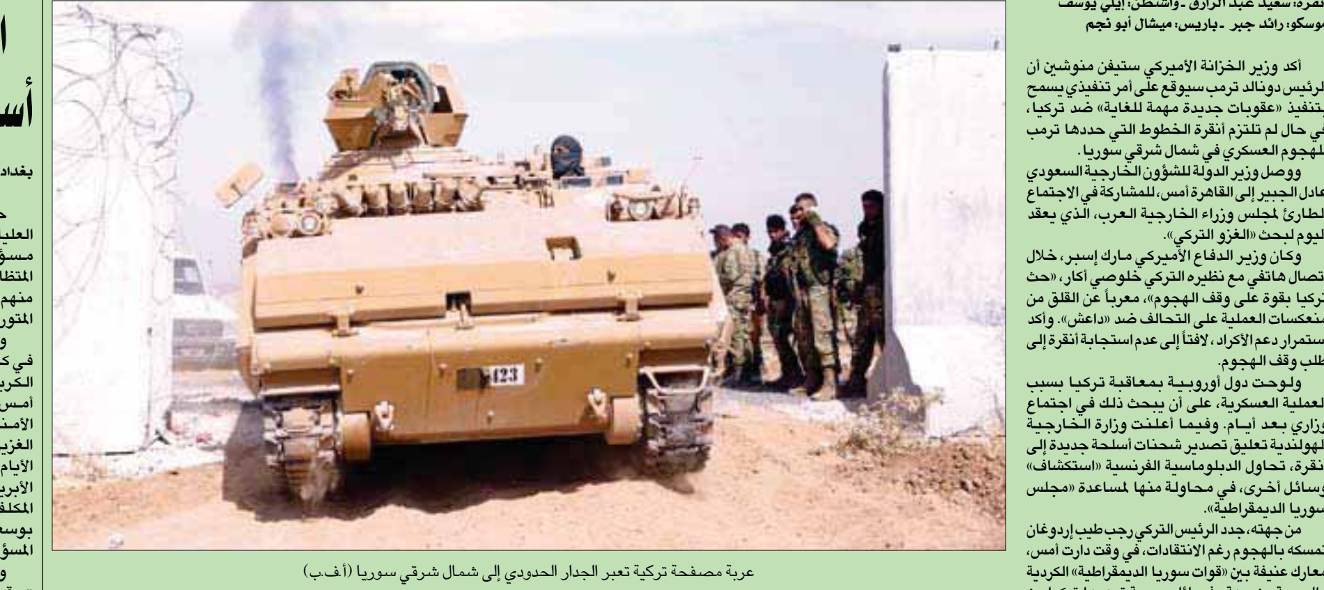
عربة مصفحة تركية تعبر الجدار الحدودي إلى شمال شرقي سوريا