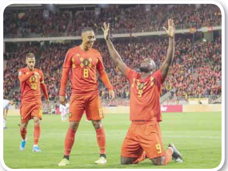
لوكاكو ساهم بهدفين من أهداف بلجيكا التسعة

واحتل منتخب قبرص المركز الثالث برصيد عشر نقاط، فيما وجد منتخب كازاخستان في المركز الرابع بسبع نقاط، بفارق نقطة أمام