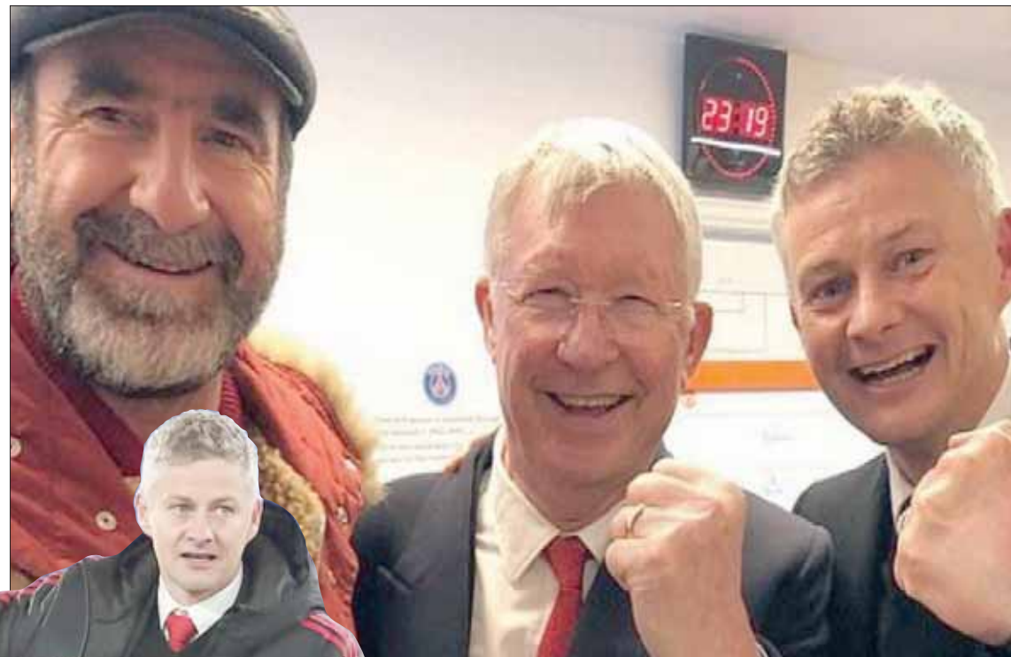
مر وقت طويل على نشوة الفوز على سان جيرمان واحتفال سولسكاير مع فيرغسون وكانتون بالتتيجة

من ذلك، يتعرض المدير الفني النرويجي لكثير من الضغوط في كل مباراة يخوضها كل أسبوع، وحتى الصورة الجيدة التي يحملها له جمهور النادي منذ أن كان لاعباً بدافع عن الوان النادي قد تخفت قليلاً. ما الذي يمكن القيام به للخروج من هذه الأزمة؟ ربما يمكن للنادي أن يحاول عزل المدير الفني، والتعاقد مع مدير فني بديل، وربما يحاول النادي التصرف بسرعة لإعادة الأمور إلى نصابها الصحيح قبل نهاية فترة التوقف الحالية بسبب الأجنحة الدولية. ولو اتبع النادي هذا المسار في العمل، فسيكون نائب الرئيس التنفيذي إد وودوارد ملزماً بإيجاد حل لهذه المشكلة. ومن