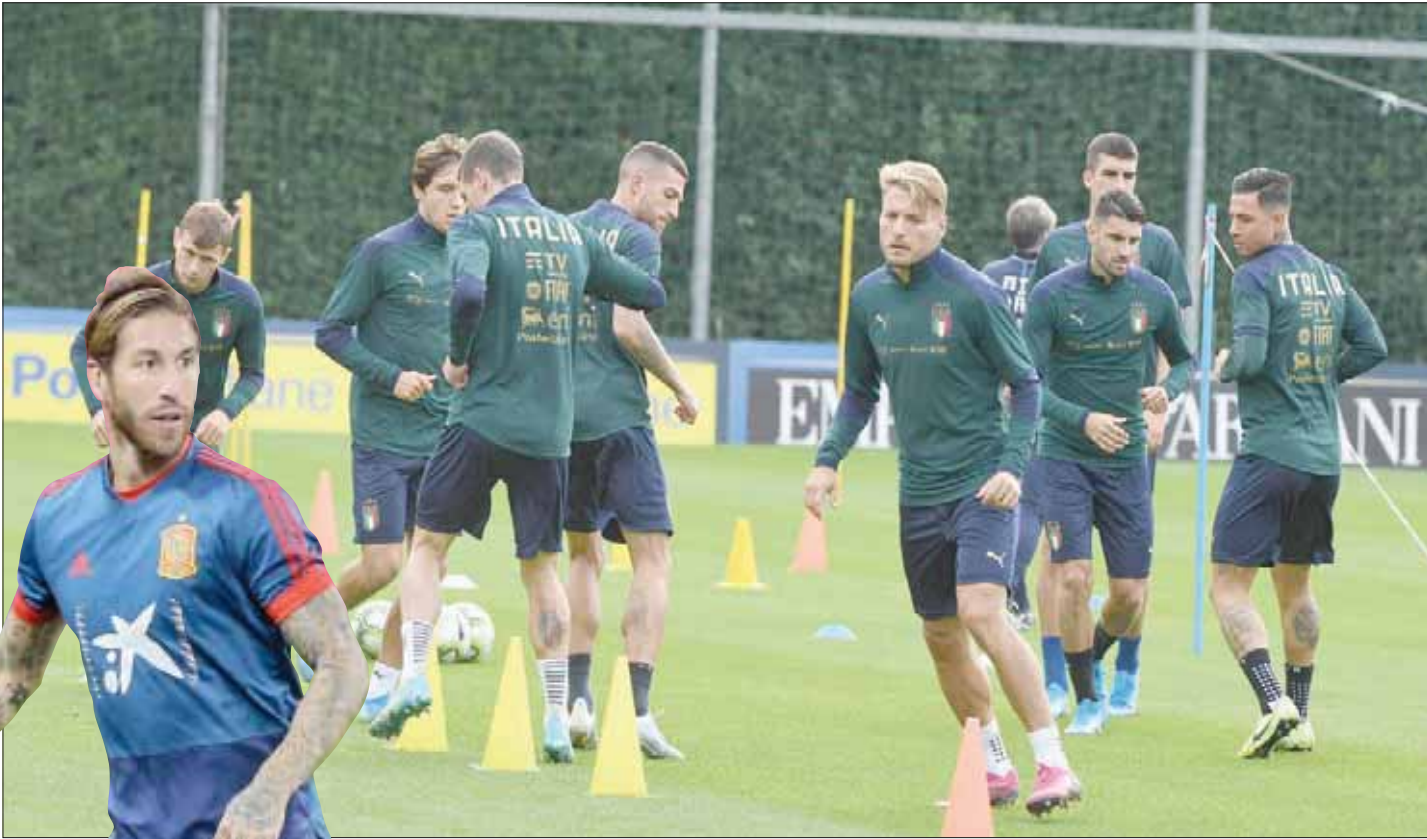
المنتخب الإيطالي يحتاج إلى 3 نقاط جديدة من أجل ضمان التأهل للنهائيات

يوم الثلاثاء المقبل، في المباراة التالية بالتصفيات، كما يختتم مسيرته بالتصفيات في نوفمبر (تشرين الثاني) المقبل، بمباراته أمام المنتخبين البوسني والأرميني. وتشهد المجموعة الثانية بفارق 6 نقاط عن إيطاليا مع مضيفتها البوسنة والهرسك الرابعة التي ستحاول تعويض تكساتها الأخيرة، فيما تأمل أرمينيا في تحقيق فوزها الرابع في 5 مباريات، عندما تحل ضيفة على ليشتنشتاين الغتواضة متذيلة الترتيب، في محاولة لتضييق الخناق على وصافة المجموعة.