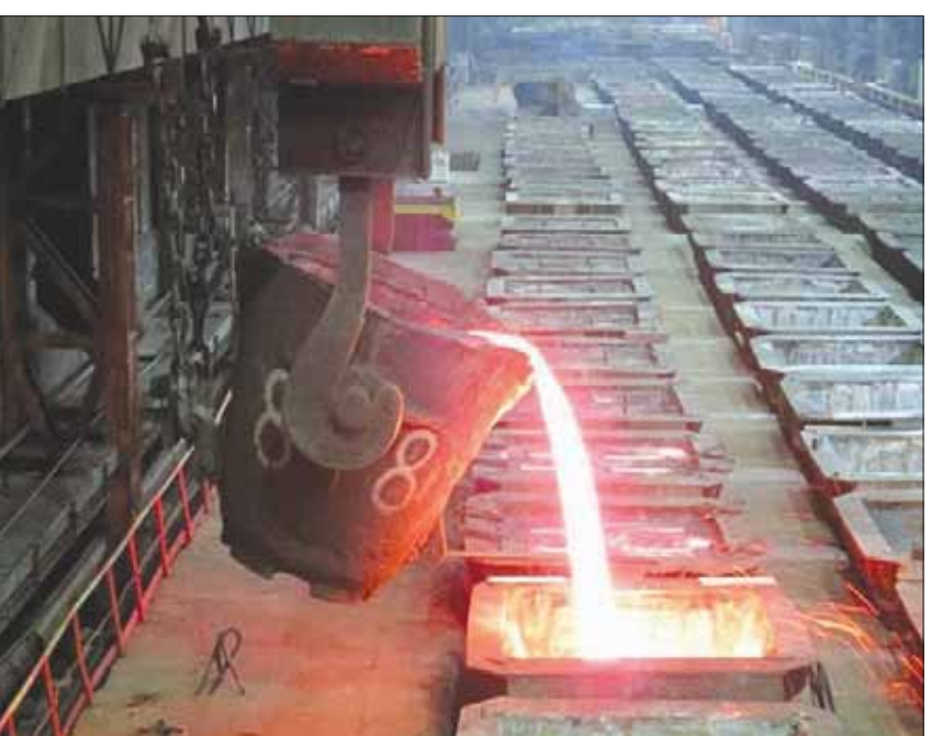
نيكل منصهر يجري صبه في أوعية بصنع للمعدن

ويختتم: «تعدّي المضاربات الدولية القفزة النوعية في أسعار النيكل حالياً، فهناك جهة واحدة تتحكم بـ50 إلى 79 في المائة من موجودات معدن النيكل