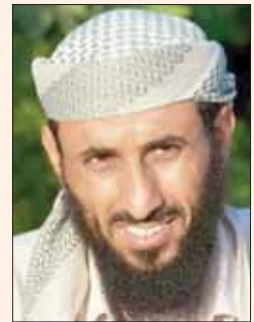
إبراهيم العسيري

في ذلك الوقت، كانت شائعات قد ترددت عن وفاة العسيري منذ عام على الأقل». وقالت وكالة «أسوشيتد برس» بان العسيري كان وضع عبوات ناسفة استخدمت في الهجوم القاتل الذي وقع في أعقاب ميلاد عام 2009 على متن طائرة تجارية متجهة إلى الولايات المتحدة. مساعدة وزير الدفاع للعلاقات حبر لطابعة في عام 2010 لاستهداف طائرة تجارية أخرى. في ذلك الوقت، قالت دانا هويت، مساعدة وزير الدفاع للعلاقات العامة، بان العسيري كانت له صلة بتخطيط داعش، لكنها، في مقابلة مع تلفزيون «فوكس»، رفضت الحديث عن التفاصيل. ورفضت، أيضا، الحديث عن تفاصيل قتله، واكتفت بالقول: «لم يعد العسيري قادرا على صناعة قنابل لتخطيط داعش».