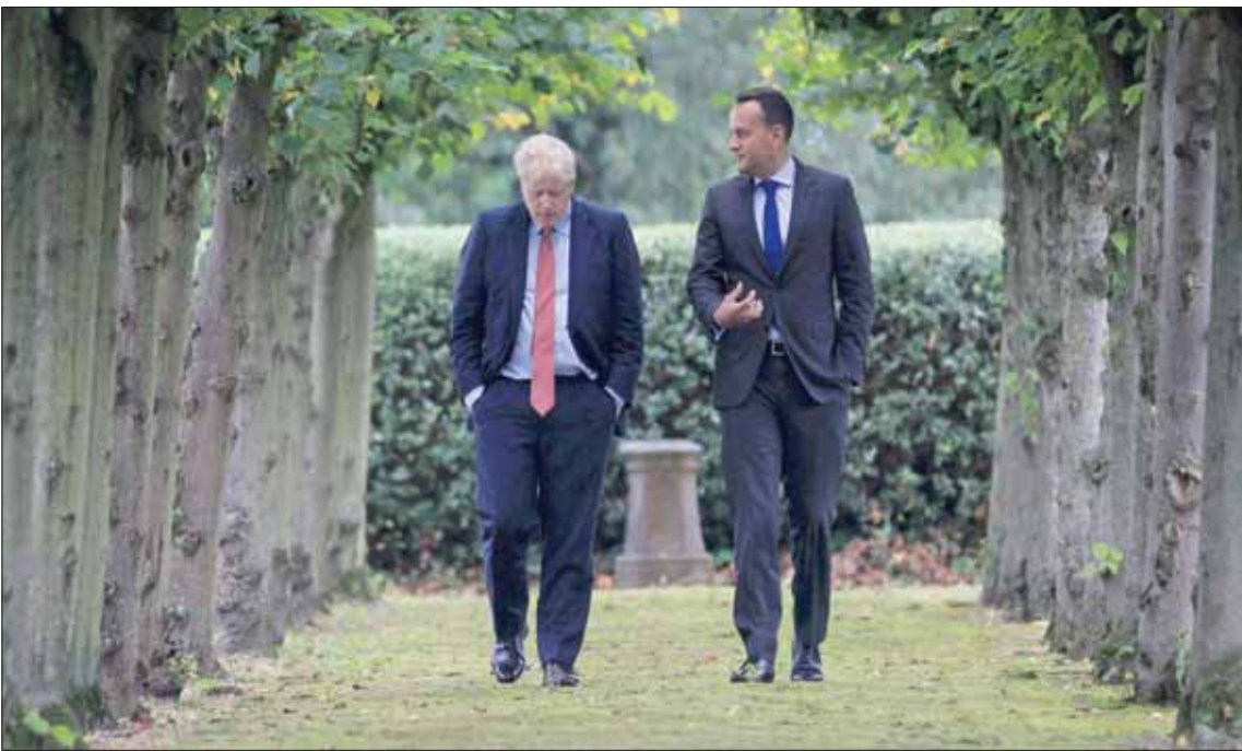
تكتمت جميع الأطراف حول محادثات جونسون مع فارداكار (يمين) الخميس لكن أجمع الكل أنها كانت مشجعة

الخطابة إلى 5 في المائة خلال العامين المقبلين. وذكر البنك أنه «في حال الخروج من دون اتفاق، سوف تتأثر القنوات الاقتصادية الرئيسية من خلال صدمات تصب معدلات الغائدة والتجارة والاستهلاك والاستثمار، ما سيؤدي إلى تدهور واضح في الأوضاع الاقتصادية».