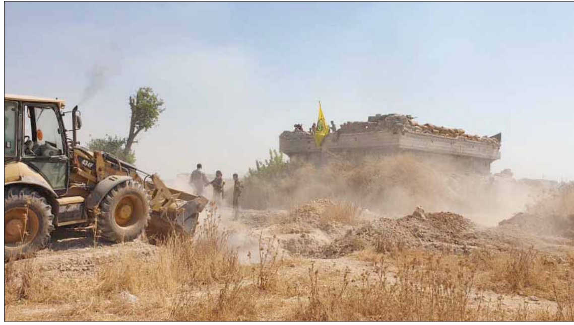
صورة وزعها حساب لـ«قسد» عن استكمال هدم تحصينات كردية على الحدود مع تركيا أول من أمس

وتقديهما مجاناً للوحدات الكردية بحجة محاربة «تنظيم داعش»، في حين لا تستطيع تركيا شراء تلك الأسلحة من واشنطن بأثمانها. ولفتت إلى أنه ظهر تنظيم مفتعل تحت اسم «قوات سوريا الديمقراطية» (قسد)، وأنه ليس سوى غطاء أو مظلة ومنظمة إرهابية، ولا يختلف عن حزب العمال الكردستاني الذي تصفه تركيا والولايات المتحدة منظمة إرهابية.