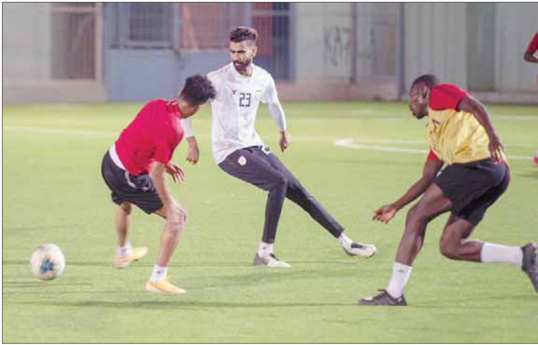
من استعدادات الشباب لمباراة الساوره الجزائري اليوم