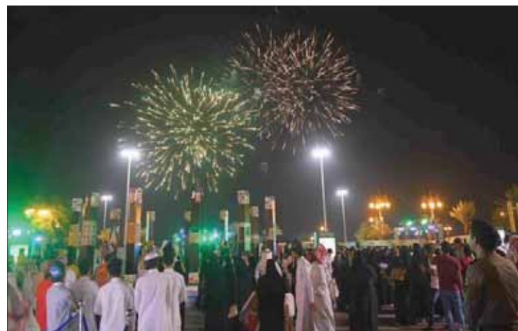
هيئة الترفيه تواصل تنفيذ فعالياتها بتبوك احتفاءً باليوم الوطني الـ 89