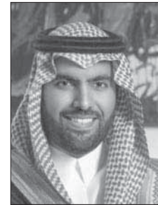
بلدر بن عبد الله بن فرحان*

لأهمية التواصل الثقافي العالمي، ومحفزاً على مد جسور التواصل الآخر من أجل تعزيز السلام والاستقرار في العالم.