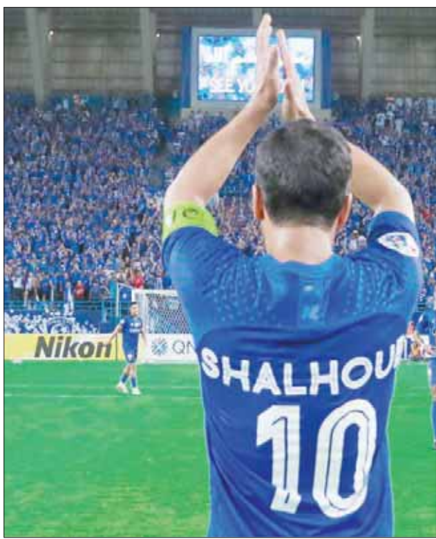
الشهوب يحيي جماهير فريقه بعد بلوغ نصف نهائي دوري أبطال آسيا على حساب الاتحاد (الشرق الأوسط)

وسيعرض «ممر المشاهير» نحو 10 آلاف نجمة، التي من ضمنها نجمة محمد الشهوب، حيث تكرم دبي عدا من المشاهير والمؤثرين، الذين تركوا بصمة ذهبية على صفحات التاريخ الإنساني وفي ذاكرة الناس، والذين أطلقوا أخيراً العنان لترشيحاتهم لأول 400 نجم وشخصية، ستسعى نجومهم «ممر المشاهير» الذي يتخذ من وسط مدينة دبي مكاناً له. وسيعرض مشفى المشاهير «نجوم دبي» بمثابة تحية إلى شخصيات بارزة تركت بصمة ملموسة في العالم من مجالات متنوعة تشمل الموسيقى والسينما والفنون والهندسة المعمارية والرياضة والأدب، إضافة إلى الشخصيات الاجتماعية المؤثرة.