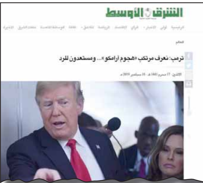
الغربية والخليج فقط، قائلاً إنه «من الصعب على العقل السياسي الغربي الذي تناول فيه مدى خطر إيران على أمن العالم واستقراره، وليس الدول العربية والخليج فقط، قائلاً إنه «من الصعب على العقل السياسي الغربي

وحاز أيضاً مقال الكاتب سمير عطا الله في العلوم السياسية، على اهتمام القراء، الذي ذكر فيه الكاتب مقتطفات عن المؤرخ أونجين برميغيتش خلال دراسته منحة دراسية في جامعة أكسفورد خلال الحرب البوغوسلافية، ومدى تشابه الحالة مع الموقف الحالي في الشرق الأوسط بعد «هجمات أرامكو».