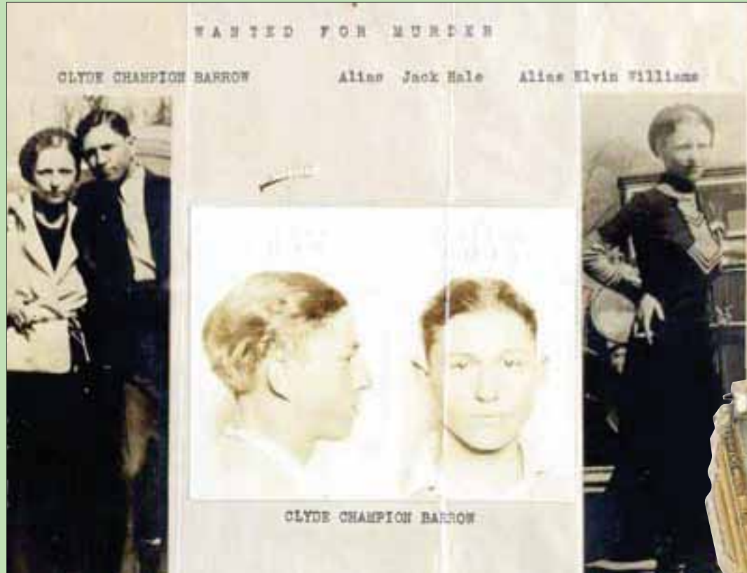
منشور لشرطة دالاس «مطلوب للعدالة» في المزاد

العاشقون. وهنا نجد هذين الحبيين اللذين عاشا في أشد كساد في التاريخ، والذين كانا يقومان بما كانا يعتقدان أنه صواب، وأضاف أنها «تكد تكون مأساة شكسبيرية في لويزيانا». وبوني وكلايد هما زوجان أميركيان اشتهرا خلال فترة الثلاثينيات من القرن الماضي بجرائمهما التي روغت جنوب الغرب الأمريكي. كلايد تشيستنت بارو (24 مارس/ آذار 1909 - 23 مارس 1934) وبوني إليزابيث باركر (01 أكتوبر/ تشرين الأول 1910 - 23 مارس 1934) هما خارجان عن القانون سارقان ومجرمان، أو كما كان يطلق على أمثالهم أثناء فترة الكساد الكبير أعداء المجتمع. وقد جذبت جنازة بوني باركر في دالاس 20 ألف شخص، وجنازة كلايد بارو في شخص. ولد كلايد تشيستنت بارو في عائلة أحد مزارعي تكساس الفقراء بمقاطعة اليس، ولاية تكساس الأمريكية بجانب بلدة صغيرة تدعى تيليكو جنوب مدينة دالاس، ومن المعروف عن كلايد أنه كان شخصاً جذاباً بشعره الكثيف وعينه العسلية اللتين يوافق لونهما لون شعره، ولكن هذا الشاب الوسيم لم يحظ بحياة الأشخاص الجذابين فقد كان أبواه يعانين من فقر شديد، وكان العائل الوحيد لهما.