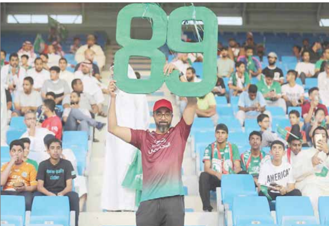
مشجع اتفاقي يرفع الرقم 89 بمناسبة احتفالات الملكة بيومها الوطني