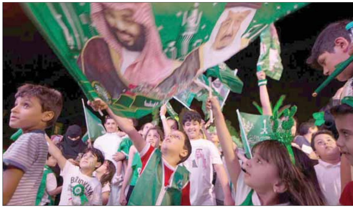
جانب من احتفال أهالي الرياض باليوم الوطني (واس)

ورفع سفير خادم الحرمين الشريفين لدى تونس، محمد بن محمود العلي، في كلمة القاها خلال الحفل، التهنئة لخادم الحرمين الشريفين الملك سلمان وولي العهد.