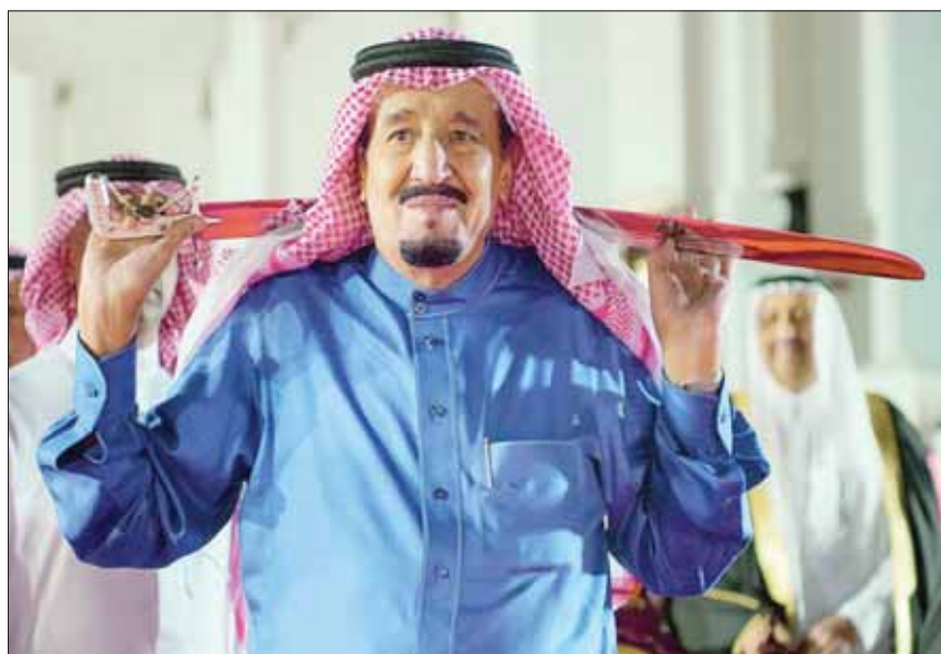
الملك سلمان يؤدي العرصة

مشهدي قصائد الحرب، والثانية مجموعة حملة الطبول، حيث يتوسط حامل العلم صفوف المجموعتين ليبدأ متنشداً القصائد في أداء الأبيات وترديدها، ثم يليها الأداء مع قرع الطبول لترتفع السيوف.