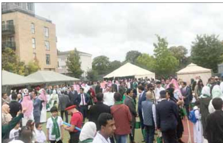
جانب من الاحتفالات التي أقامتها السفارة السعودية لمواطنيها في لندن أسس

أما في جدة وعلى كورنيش الحمراء، فتقام فعالية «مملكة النجوم»، حيث ستطلق آلاف الألعاب النارية من عرض البحر في وقت واحد بالوان رائعة، لتشكل