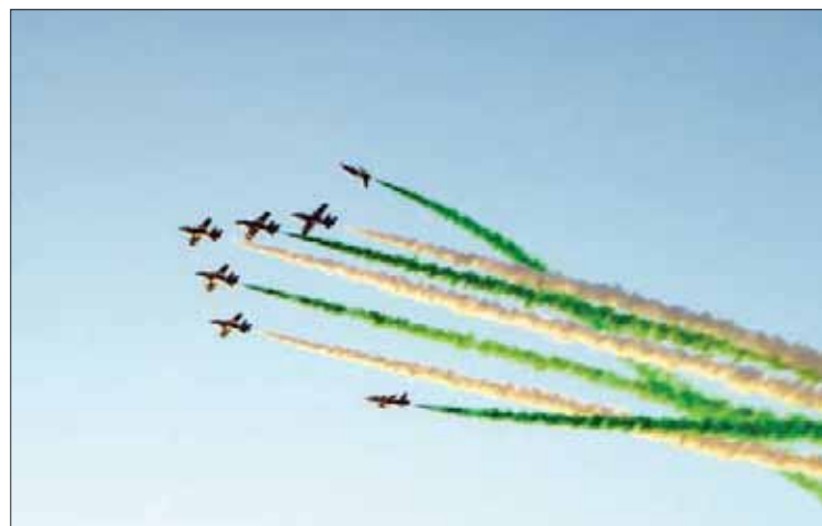
استعراضات جوية احتفاءً باليوم الوطني الـ 89 في سماء مدينة الرياض