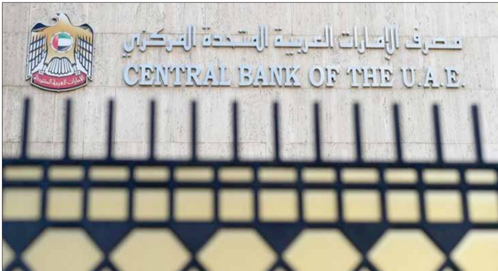
البنك المركزي الإماراتي (وأم)

مليار دولار) في الربع نفسه من عام 2018، غير أن الإيرادات الأخرى عوضت انخفاض الإيرادات الضريبية، حيث ارتفعت بمقدار 5,3 مليار درهم (1,4 مليار دولار)، أو ما نسبته 9,5 في المائة، لتصل إلى 61,2 مليار درهم (16,6 مليار دولار) مقابل 55,9 مليار درهم (15,2 مليار دولار) في الربع المماثل من عام 2018. وظلت المساهمات الاجتماعية ثابتة نسبياً عند 3,1 مليار درهم (843 مليون دولار) في الربع الأول من عام 2019.