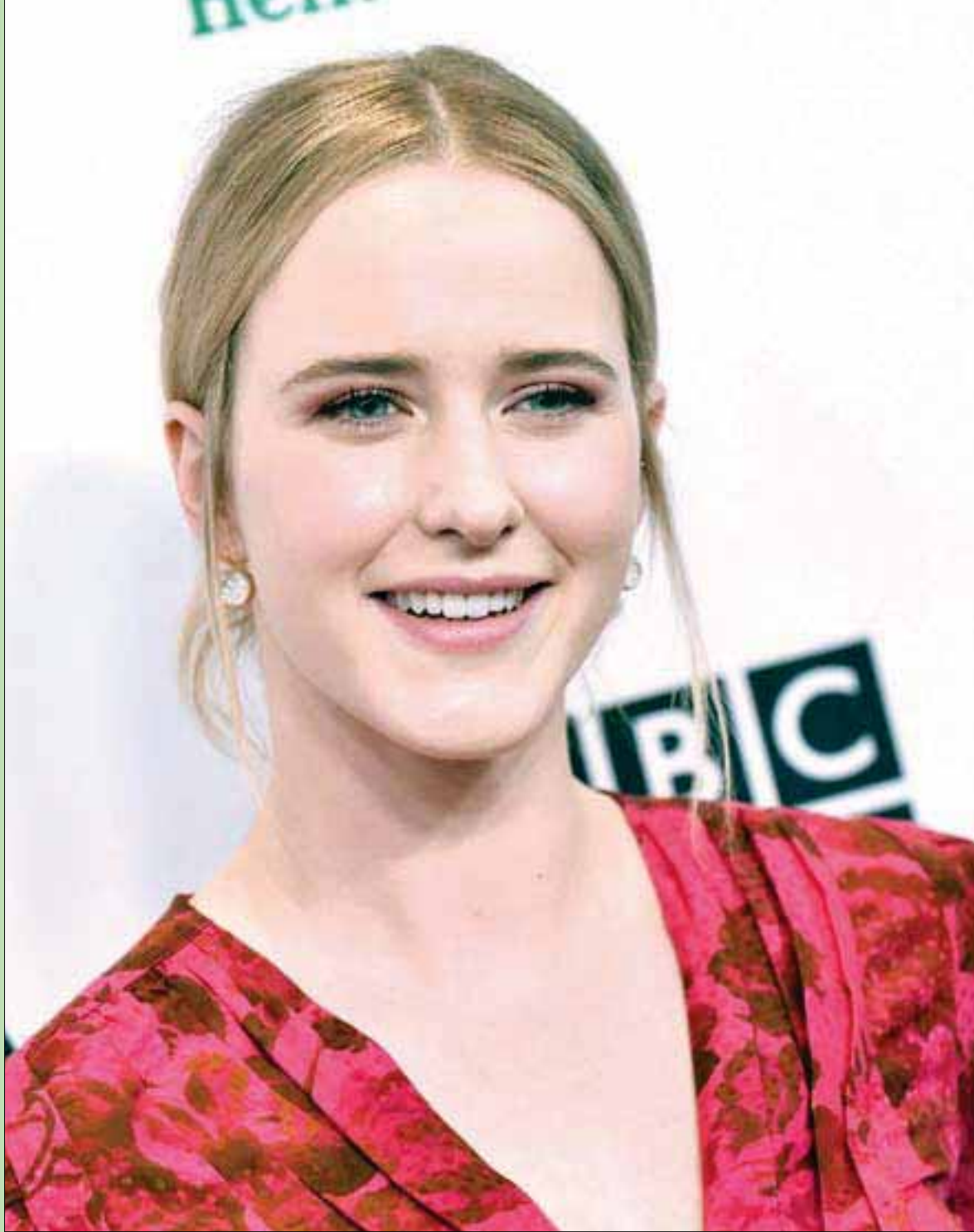
المثلة الأميركية راشيل برونسهايم تحضر حفل «باقتا لوس أنجليس» وتلفزيون «بي بي سي أمريكا» في فندق بكاليفورنيا

لكان جاء إلي لكي أزيد من الحقائق ما لا يحلم به، خصوصاً عن ذلك اللقاء معي يوم ظن أنني لا أسمع ولا أصغي. وكان ذلك صحيحاً، فقد كنت مأخوذاً في مراقبة أعضاء الوفد وهم يرتجفون».