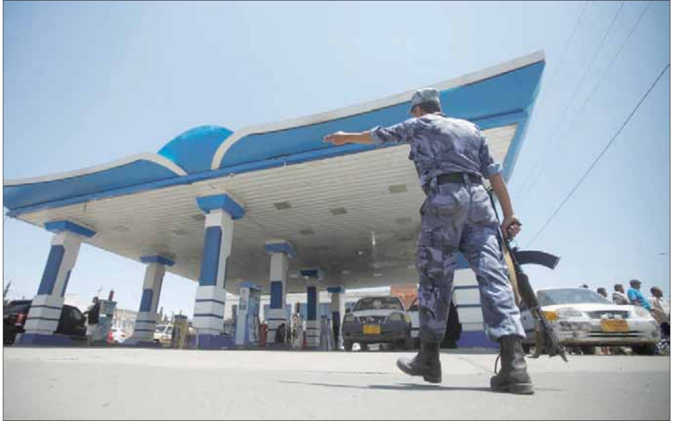
مسلح أمام محطة وقود في صنعاء