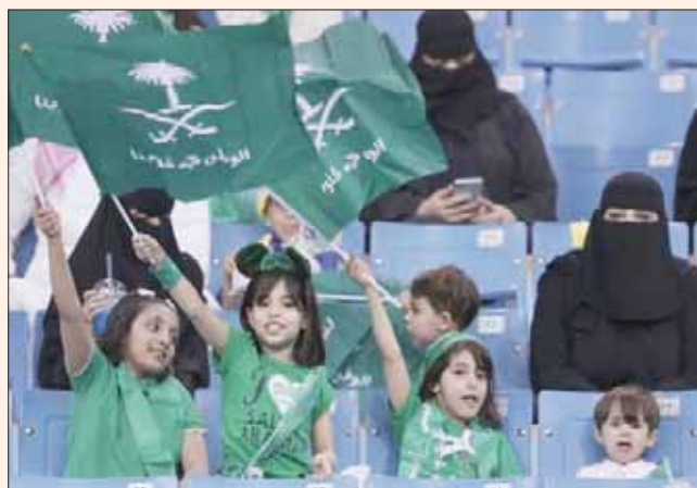
فتيات يحملن أعلام الملكة في ديرة الملاعب بالرياض

الغربية السعودية باليوم الوطني الـ 89. وانطلقت الجولة الرابعة من دوري المحترفين الخميس الماضي على مدار 3 أيام متتالية، حيث شهد اليوم الأول لقاءً وحيداً يجمع ضمك بالشباب في مدينة الأمير سلطان الرياضية وانتهى بالتعادل الإيجابي 1 - 1 لكلا الفريقين، وذلك بعد أن تم تأجيل لقاء الرائد بالتعاون إلى 6 نوفمبر (تشرين الثاني) المقبل.