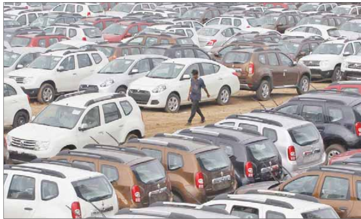
تواجه صناعة السيارات في الهند حالة من الركود مع انحسار عنيف للمبيعات

جديد كمنطقة انطلاق إلى داخل الهند. ومع هذا، جاء أداء مبيعات سيارات «داتسون» أسوأ من مجمل أداء سوق السيارات الهندية هذا العام، ذلك أنها انخفضت بنسبة 61 في المائة لتستقر عن مستوى مبيعات هزيل بلغ 1,132 سيارة خلال يونيو (حزيران). اليوم، وفي إطار عملية إعادة هيكلة أوسع داخل الشركة اليابانية، تخصص الهند بحلول نهاية مارس (آذار). وتعد شركات أخرى كذلك إلى خضض إنتاجها. مثلاً، أوقفت «تويوتا موتور كورب» إنتاجها من مصنعيها في بنغالور لمدة خمسة أيام في أغسطس، بهدف كبح جماح المخزونات المتضخمة. جدير بالذكر أن مبيعات «تويوتا» انخفضت بنسبة 13 في المائة إلى 89,800 مركبة خلال العام المنتهي في أغسطس. من جهتها، نجحت شركات دخلت السوق الهندية حديثاً، مثل «كيا» من كوريا الجنوبية و«إم جي موتور» من الصين، في استغلال حداثة مشاركتهما في السوق. على الطرف المقابل، تعتمد أسماء عالمية كبرى على شركات