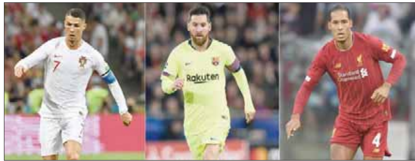
فان دايك وميسي ورونالدو في انتظار جائزة الأفضل بالعالم اليوم

هذا الصيف. وساهم العملاق الهولندي (193 سم و92 كلغ) في الموسم الماضي بقيادة ليفربول إلى التتويج بطلاً لدوري أبطال أوروبا، وإنهاء الدوري المحلي الذي احتكره فريقه لمانشستر سيتي بفارق نقطة واحدة فقط. كما اختير أفضل لاعب في الدوري المحلي لموسم 2018-2019، ليصبح أول مدافع يفوز بذلك منذ جون تيري، مع تشيلسي عام 2005. ويدافع الهولندي عن الوان ليفربول منذ يناير (كانون الثاني) 2018، حين انتقل إليه من سوثهامبتون. في صفقة قياسية حينها بالنسبة لمدافع،