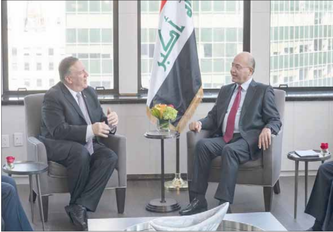
الرئيس العراقي برهم صالح خلال لقائه وزير الخارجية الأميركي مايك بومبيو في نيويورك أمس

للمرة الثانية في غضون أقل من شهرين تستهدف طائرات مجهولة مقرات للحشد الشعبي في المناطق الواقعة غرب العراق. فبعد مقتل علي الدبي، مسؤول الإسناد في «كتائب حزب الله» العراقي بقصف جوي في منطقة القائم على الحدود بين العراق وسوريا خلال شهر أغسطس (آب) الماضي، أعلن مصدر أمني ومصادر في «الحشد» عن قيام طائرة مجهولة بقصف أحد المعسكرات التابعة له في منطقة الرطبة أقصى غرب العراق، وطبقاً للمصادر ذاتها فإن القصف أدى إلى وقوع خسائر مادية دون أن تقع خسائر بشرية.