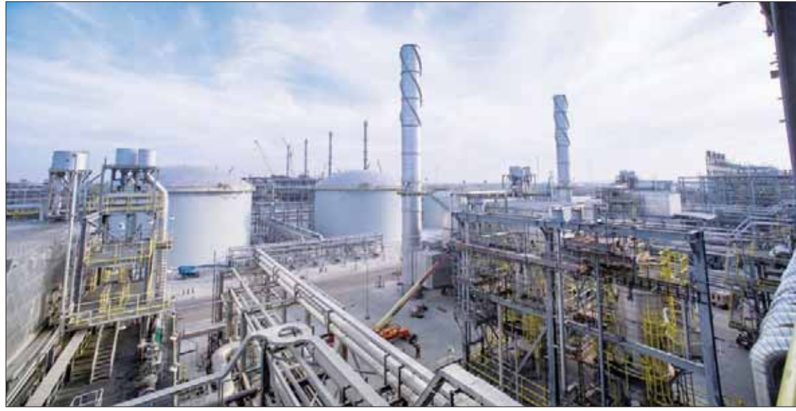
تسببت الهجمات على «أرامكو» باشتعال حرائق وإلحاق أضرار لكن الشركة احتوت أثرها سريعاً

ما من شأنه إعادة الأمور إلى نصابها، واستعادة عمليات إنتاج النفط إلى المستويات الطبيعية التي كانت عليها قبل الهجوم. ويعتقد أونتيكوف بأن السعودية ستجد الدعم المعنوي من الدول الأخرى في العالم، باعتبار أن الكل مهتم باستقرار أسعار النفط العالمية، مرجحاً أن يكون هذا التوتر في حده الأدنى القصر بتأثير محدود يمكن احتواؤه بشكل سريع. كان أمين الناصر، الرئيس وكبير الإداريين التنفيذيين لشركة «أرامكو السعودية»، قد قال في رسالة لموظفي الشركة أول من أمس، إن «أرامكو» باتت بعد الهجمات على معاملها النفطية في بقيق وخریص في 14 سبتمبر (أيلول) «أقوى من ذي قبل». وتسببت الهجمات التي وقعت في 14 سبتمبر على منشآتي بقيق وخریص، وهما من أكبر معامل معالجة النفط في المملكة، في اشتعال حرائق كبيرة، وإلحاق أضرار جسيمة،