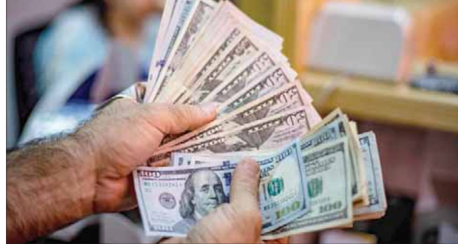
تاجر يحمل دولارات في القامشلي شمال شرقي سوريا

كبيرة»، في ظل انعدام الثقة بالنظام الذي يمنع تداول القطع الأجنبي ثم يطلب من رجال الأعمال إيداع القطع في المصارف الحكومية».