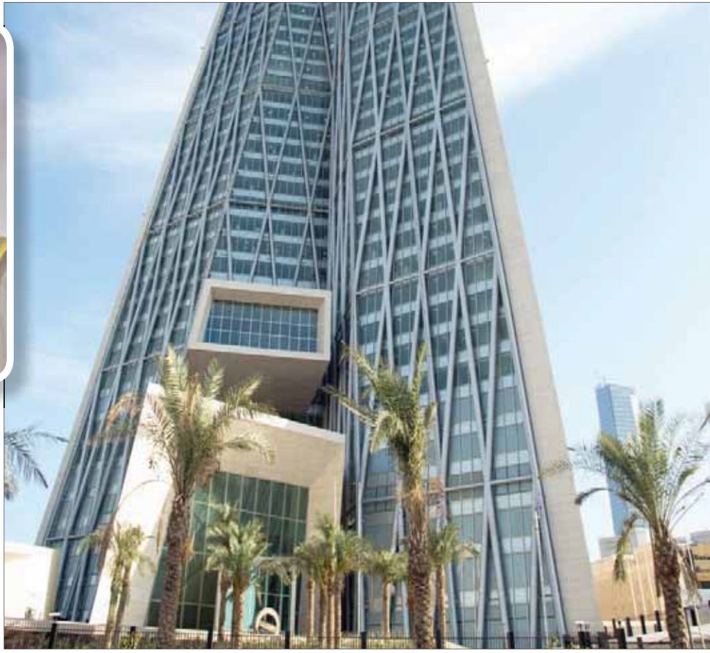
بنك الكويت المركزي وفي الإطار محافظ البنك الدكتور محمد يوسف الماشل

2) خلق القيمة من حيث نوعية وأسلوب تقديم الخدمات، وتزويد العملاء بالنصح والاستشارات مع الاهتمام بولائهم على المدى الطويل، وليس النظر إليهم كهدف ربح على المدى القصير. 3) رفع الكفاءة في إطار معرفة البنوك لتطلعات العملاء ورغباتهم من خلال الاستفادة مما لديها من بيانات مالية في تحليل تنبؤي موجه للتعرف في معرفة رغبات عملائها وميولهم تم تلبيتها. 4) تعزيز المثانة وهو ما يتطلب من البنوك أن تحافظ على قوة أوضاعها المالية ومؤشرات السلامة المالية لديها. 5) وأخيراً استقطاب المواهب انطلاقاً من أن رأس المال البشري هو العنصر الأساسي الذي من خلاله تحقق البنوك أغراضها.