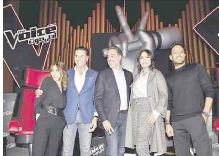
النسخة الجديدة من «ذا فويس»

التطور التكنولوجي الذي تشهده الساحة من خلال الإنترنت والصفحات والمواقع الإلكترونية المعروفة. فهذه الأخيرة اتخذت عنواناً عريضاً لها إلا وهو المحتوى التلفزيوني الأفضل، لتستثمر فيها ملايين الدولارات ومن دون يرمجة تلفزيونية مسيئة مدموجة بالكلاسيكية القديمة. وهذه الشركات المستخرمة من منصات وصفحات إلكترونية شهيرة أصبح لديها مبالغ مالية ضخمة ارتأت استثمارها في العمل التلفزيوني. فالأعمال السينمائية لم تعد تقي بجاحتها ولا تصيب أهدافها الرئيسية الممنثلة بتحقيق أرباح مالية تصل إلى 20 في المائة من استثماراتها هذه. ولا أذيع سراً إذا قلت إن «إم بي سي» كانت السبابة في استخدام هذا التطور التكنولوجي في العالم العربي من خلال تأسيسها منصة إلكترونية خاصة بها (شاهد) التي تضع لها برمجة استثمار منمقة إلكترونية خاصة بها (شاهد) إنتاج أعمال تلفزيونية خاصة بهذه المنصة، لا تزيد حلقاتها على 10 أو 12 حلقات ولا تتجاوز مدتها 30 دقيقة. كـ(ديفا) الذي سنطلقه في نوفمبر (تشرين الثاني) المقبل ولنعرضه بعدها على شاشة «إم بي سي». فهذه المنصة نعتبرها سلاحنا الأساسي لمواجهة منصات عالمية أخرى (نتفليكس) و(أمازون) وغيرها. ونفرد بها في العالم العربي لتقديم إنتاجات بالعربية لا يملك