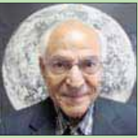
العالم المصري فاروق الباز

يناير (كانون الثاني) 1938، في مدينة الزقازيق بمحافظة الشرقية، وحصل على شهادة البكالوريوس في علوم الكيمياء والجيولوجيا في جامعة عين شمس، وحصل على شهادة ماجستير في الجيولوجيا، عام 1961، والدكتوراه في عام 1964، ومن ثم عمل في وكالة «ناسا» من خلال برنامج أبوللو.