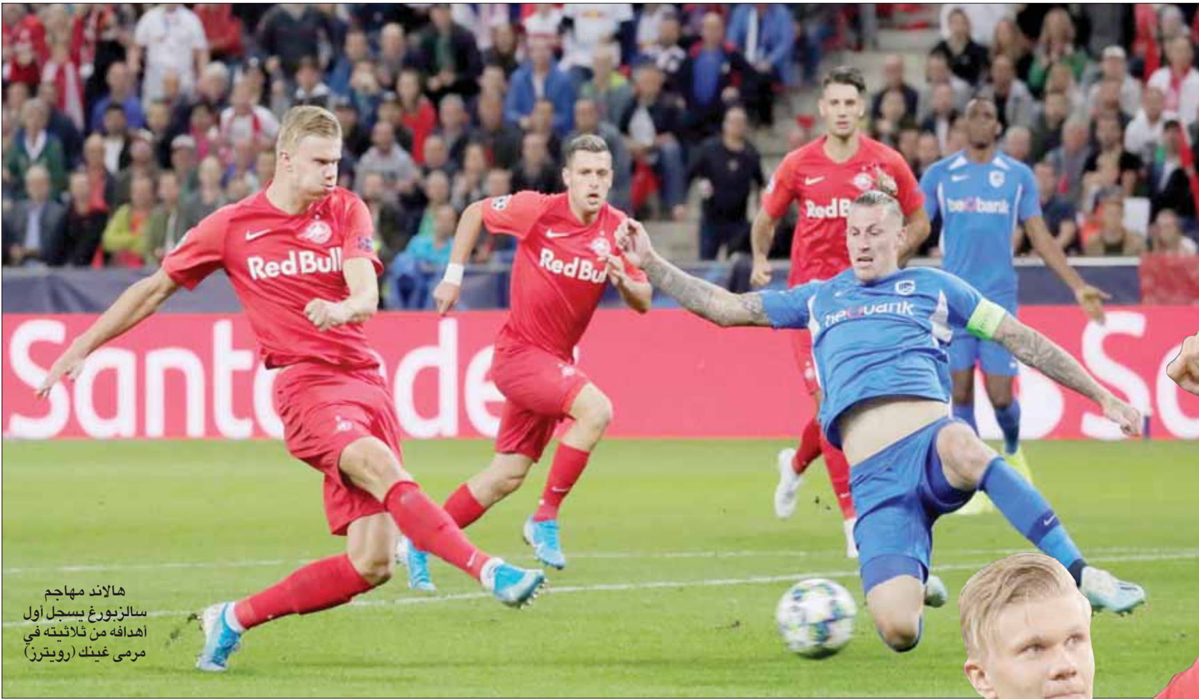
هالاند مهاجم سالزبورغ يسجل أول أهدافه من ثلاثيته في مرعى غينك

وقدم المهاجم البالغ من العمر 19 عاماً أداءً استثنائياً مع فريقه الجديد يد بول سالزبورغ النمساوي أمام نادي غينك البلجيكي في دور المجموعات بدوري أبطال أوروبا يوم الثلاثاء الماضي وسجل ثلاثة أهداف في المباراة التي