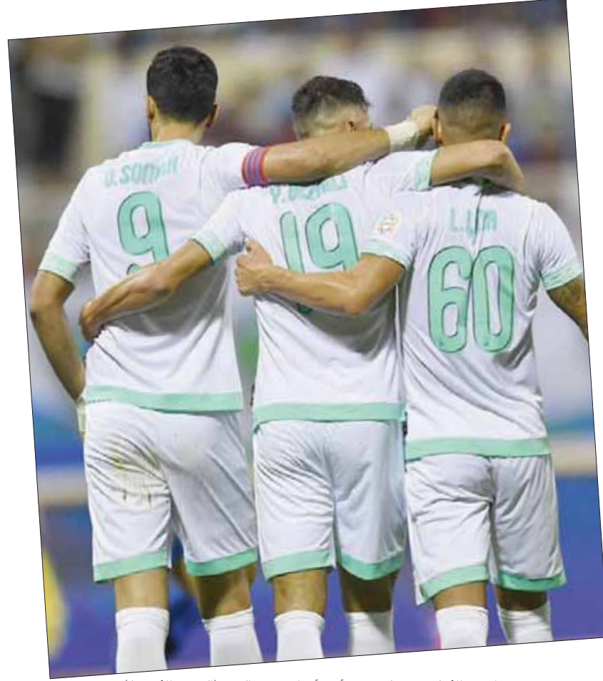
لاعب الأهلي يحتفلون بعد أحد أهدافهم في الفتح