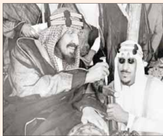
الملك عبد العزيز والملك الأول بعده الملك سعود