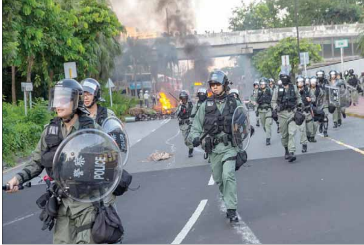
قوات مكافحة الشغب خلال مواجهات في شاتين أمس

وقعت صدامات، أمس، بين متظاهرين مناهضين لحكومة بكين وشرطة مكافحة الشغب خارج مركز تسوق في هونغ كونغ، حيث خرب بعض الناشطين محطة قطارات قريبة وشوهوا العلم الصيني لكن بدون أن ينجحوا في تعطيل حركة الملاحة في مطار المدينة.