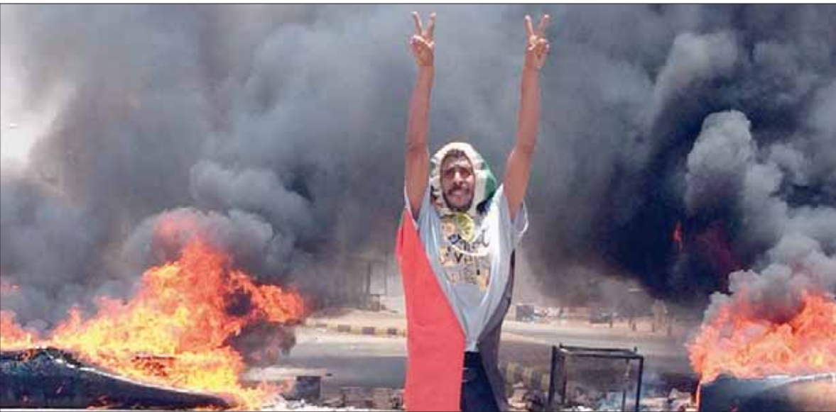
متظاهر يرفع علامة النصر يوم 3 يونيو الماضي أمام مقر قيادة الجيش في الخرطوم حيث وقعت أحداث فض الاعتصام الذي شكّلت الحكومة أمس لجنة مستقلة للتحقيق فيها (أ.ب)

أعلن رئيس الوزراء السوداني عبد الله حمدوك عن تشكيل لجنة مستقلة للتحقيق في جريمة فض اعتصام القيادة العامة الذي قتل جراءه العشرات وجرح المئات في 3 يونيو (حزيران) الماضي، والذي انتهت قوات عسكرية بارتكابها. جاء هذا التزاماً مع إصابة 4 أشخاص في مدينة نبالا غرب البلاد في مظاهرات طلابية شهدت المدينة، ورفقتها الشرطة بعنف مفرط مستخدمة الغاز والرصاص، بحسب تجمع المهنيين السودانيين.