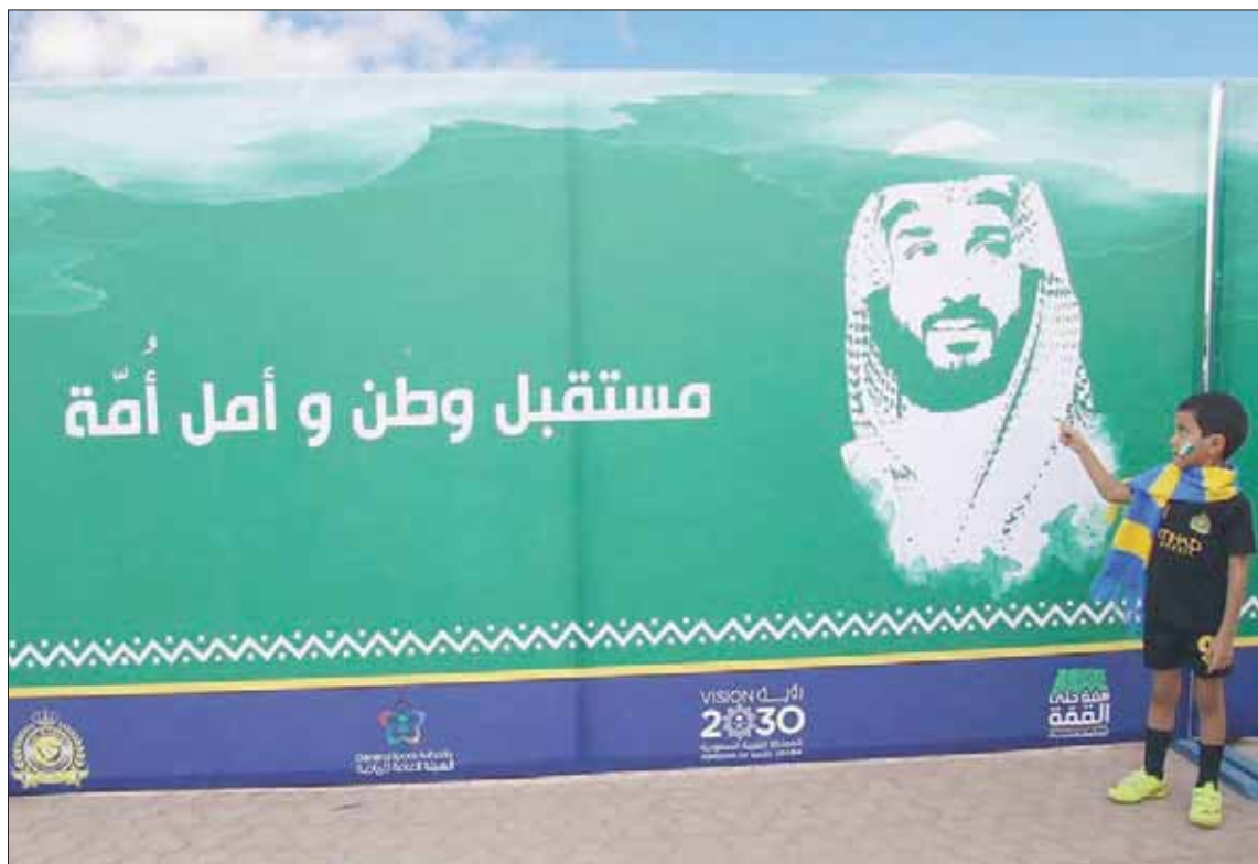
طفل نصراوي يقف إلى جانب لوحة معبرة تحمل صورة ولي العهد في ملعب الملك فهد الدولي بالرياض

استمرارية الدعم الكبير المقدم من القيادة السعودية. ويات الحراك الرياضي في السعودية مختلفاً من خلال التطور السريع الذي تشهده الرياضة في ظل الدعم الكبير من القيادة والرعاية الخاصة من جانب ولي العهد الأمير محمد بن سلمان، حيث شهدت بداية الموسم الرياضي الحالي لمسابقات كرة القدم دعماً كبيراً للأندية المحترفة وأندية الدرجة الأولى وكذلك الدرجتان الثانية والثالثة، وذلك باستمرار الدعم المالي الكبير لها مع إضافة الدعم بتحقيق منجزات وتقدم على الصعيد الفني والإداري، الأمر الذي سينعكس بدوره على مستوى رياضة كرة القدم بصورة عامة.