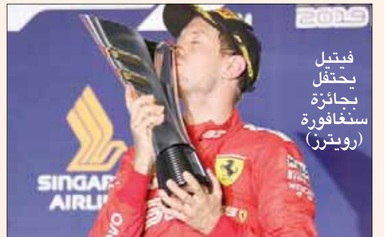
فيتيل يحتفل بجائزة سنغافورة

ثالثاً، أمام سائقي «ميرسدس»، كل من بطل العالم البريطاني هاميلتون، والفنلندي الفتييري بوتاس، اللذين حلا في المركزين الرابع والخامس توالياً. وقال فيتيل بعد الفوز: «أنا سعيد جداً، سباق رائع، شهدت أن بداية الموسم التي شهدت هيمنة فريق «ميرسدس» كانت صعبة علينا؛ لكننا بدأنا نعود»، ورفع هاميلتون رصيده في صدارة ترتيب السائقين إلى 296 نقطة، متقدماً بفارق 65 نقطة عن بوتاس، بينما تساوى لوكلير ليمينجا فريفيهما الإيطالي فوزه الثالث توالياً هذا الموسم، وتوقفاً غير متوقع على حلبة «مارينا باي» المناسبة أكثر لسيرة فريق «ميرسدس» الذي دخل السباق فائزاً في أربع من نسخة الخمس الماضية (2014، 2016، 2017، 2018).