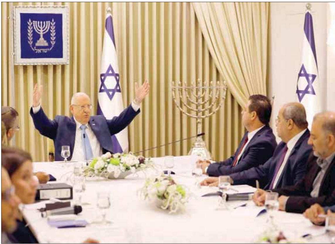
الرئيس الإسرائيلي رؤوفين رفلين مستقبلاً القائمة العربية المشتركة التي رشحت بيني غانتس لتشكيل الحكومة المقبلة

ذكر أن نتائج الانتخابات ستنتشر رسمياً الأربعاء، وعندها يكون أمام رفلين أن يواصل مشاورات ثمانية أيام ويتخذ قراره حول التكليف. وفي الغالب سيكلف غانتس، الذي أوصى بتكليف نتنهاو. ثم حزب اليهود الشريفيين عن حزب اليهود الشريفيين شاس، الذي أوصى بتكليف نتنهاو. ثم حزب اليهود الروس «يسرائيل بيتنا»، الذي قرر عدم التوصية على أي من المرشحين. وقال أفيغدور ليبرمان، إن حزبه يلاحظ أن نتنهاو وغانتس على السواء يعملان ضد حكومة وحدة