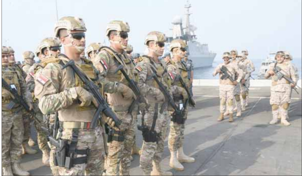
جانب من القوات المشاركة في التمرين

وقالت رويترز عن دبلوماسي غربي أن هجوم 14 سبتمبر (أيلول) «يشكل تصعيداً كبيراً، فهناك مشكلة واضحة. لكن المعضلة الحقيقية في كيفية الرد دون مزيد من التصعيد... لم ينضج بعد ما الذي تريد الولايات المتحدة فعله».