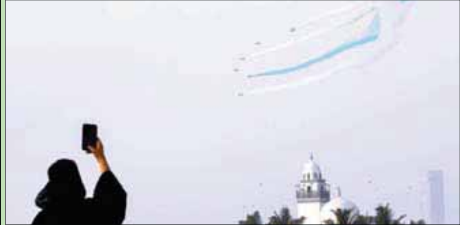
عرض جوي في سماء جدة أمس بمناسبة اليوم الوطني الـ 89 (واس)

الرياض: «الشرق الأوسط» يحتفي السعوديون اليوم باليوم الوطني الـ 89 للمملكة، وهو اليوم الذي شهد إعلان المؤسس الملك عبد العزيز بن عبد الرحمن آل سعود توحيد البلاد وتسميتها المملكة العربية السعودية، بعد رحلة كفاح استمرت 32 عاماً، أرسى خلالها قواعد البلد الذي تحول تحت قيادة خادم الحرمين الشريفين الملك سلمان بن عبد العزيز إلى رقم صعب في المعادلة الدولية.