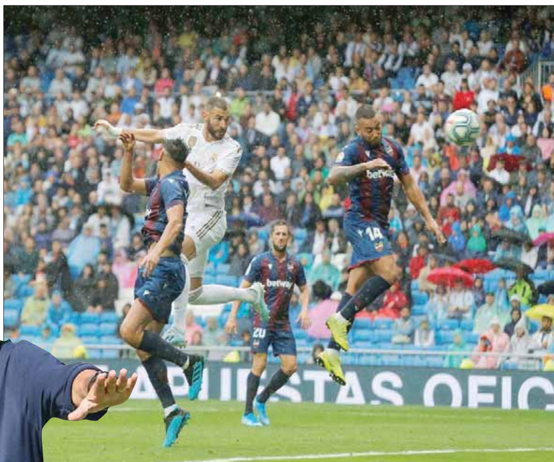
رأسية بنزيمة في طريقها لهز شبكتنا ليفانتي

زيدان: «عندما يستحوذ على الكرة، يلعب بشكل ولكن ما يحتاجه المشاركة في أكثر من حصة تدريبية. تدرب أربع مرات فقط معنا». ورداً على سؤاله: «كون هذا الفوز هو الثاني فقط