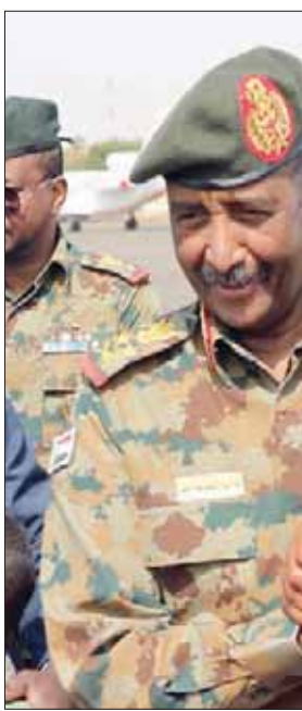
البرهان يستقبل أفريقي في مطار الخرطوم أمس

وقال حمدوك أفريقي، إن العلاقات بين البلدين عاودت نشاطها عقب عزل البشير، وشهدت الخرطوم الأسبوع الماضي، زيارة قام بها مستشار أفريقي للشؤون السياسية بماني قربات التقى خلالها رئيس الوزراء حمدوك للتهيئة بتكوين الحكومة الانتقالية وترتيب زيارة رئيسة.