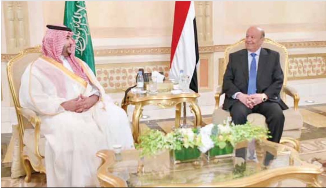
الرئيس اليمني لدى لقائه نائب وزير الدفاع السعودي في الرياض أمس

خالد بن سلمان التقى هادي بتوجيه من ولي العهد