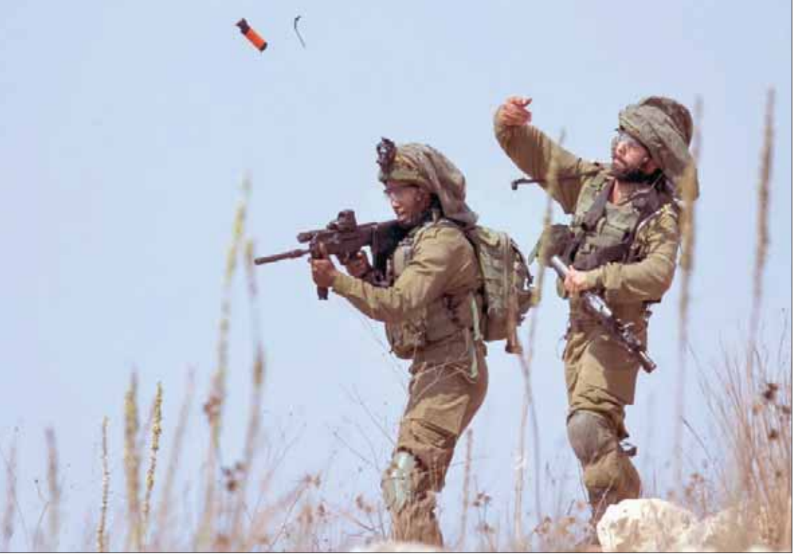
جنديان إسرائيليان يريان قذيفة على المتظاهرين الفلسطينيين في كفر قدوم بالضفة الجمعة (أ.ب)

اتهمت منظمة التحرير الفلسطينية، رئيس وزراء حكومة الاحتلال بنيامين نتنياهو، بالسعي للسيطرة على 75 في المائة من مساحة الضفة الغربية. وقال تقرير أعده المكتب الوطني للدفاع عن الأرض ومقاومة الاستيطان التابع لمنظمة التحرير، إن خطة ضم الأعراف الفلسطينية وشمال البحر الميت التي أعلن نتنياهو عن نيته تطبيقها فور تشكيل حكومته القادمة في حال فوزه في الانتخابات، هي بمثابة رأس جبل الجليد من مخطط ضم أوسع، يشمل الكتل الاستيطانية وجميع المستوطنات بما فيها البؤر الاستيطانية وبمساحة تغطي وفق التقديرات 75 في المائة من المنطقة المستهدفة، وهي التي صنفتها اتفاق المرحلة الانتقالية بين الجانبين الفلسطيني والإسرائيلي، منطقة (ج)، الخاصة بشكل كامل لسلطات الاحتلال.