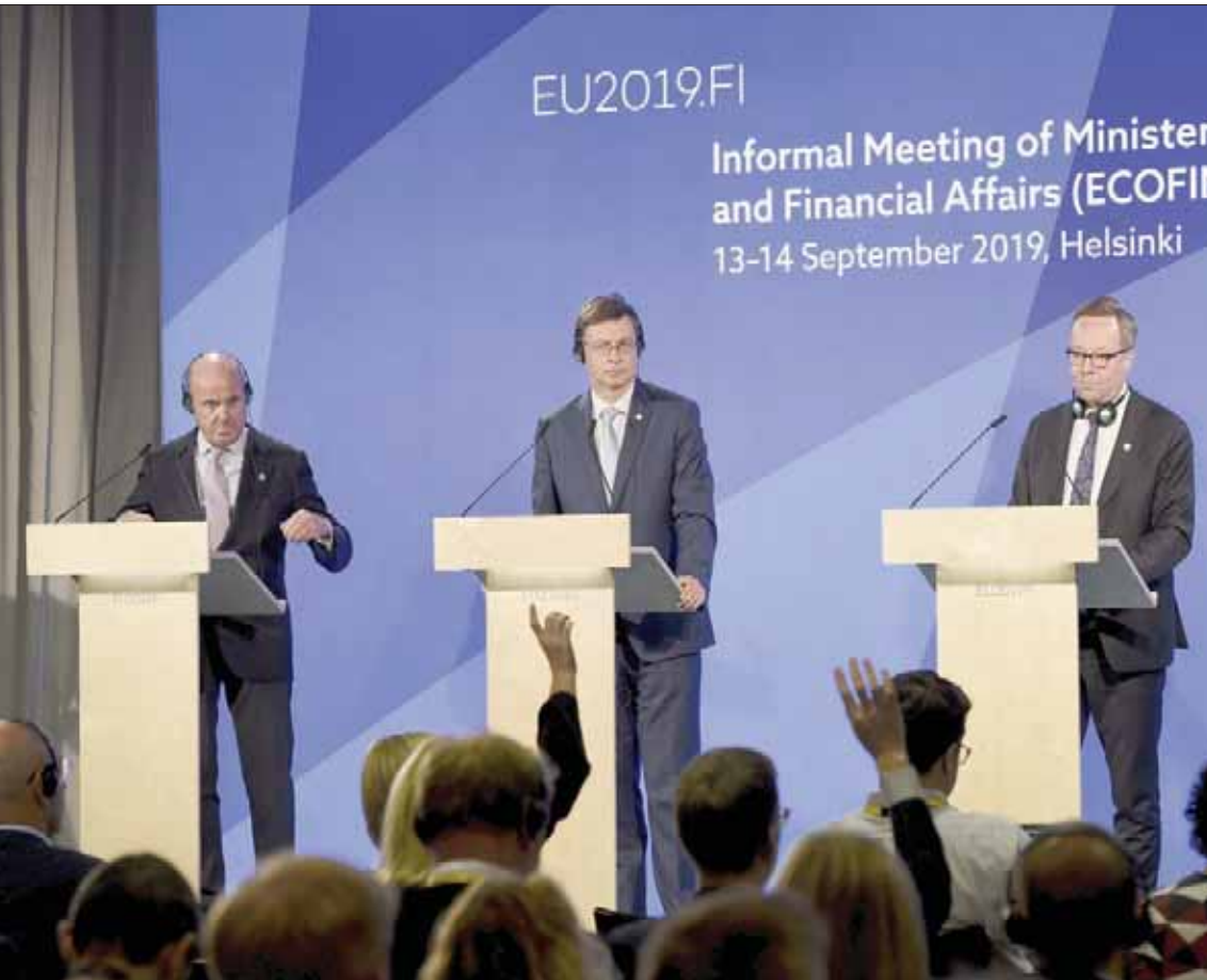
جانب من مؤتمر صحفي في ختام اجتماع وزراء مالية الاتحاد الأوروبي في هلسنكي أمس

كانت الموضوعات الرئيسية في اجندة الاجتماعات تتعلق بالقدرة التنافسية وتخفيف آثار التغيير المناخي ومدى قبول الضرائب على الطاقة. وكانت نقاشات اليوم الثاني والأخير قد تركزت حول ملف فرض الضرائب على الطاقة، وأيضا القواعد المالية للاتحاد الأوروبي. بينما تركزت نقاشات اليوم الأول على كيفية المضي قدماً في العمل المتعلق بالتغيير المناخي في نطاق مسؤوليات وزراء المال. وحسب بيان للترئاسة الدورية للاتحاد الأوروبي،