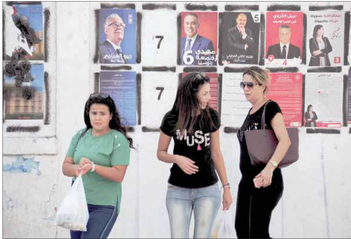
ملصقات مرشحي الرئاسة تغطي شوارع تونس استعداداً للانتخابات اليوم