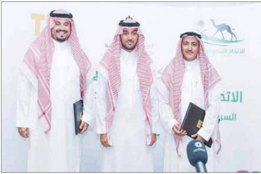
الفصل والأمير فهد بن جلوي وسعد الزهراني بعد توقيع الاتفاقية مع جامعة الطائف