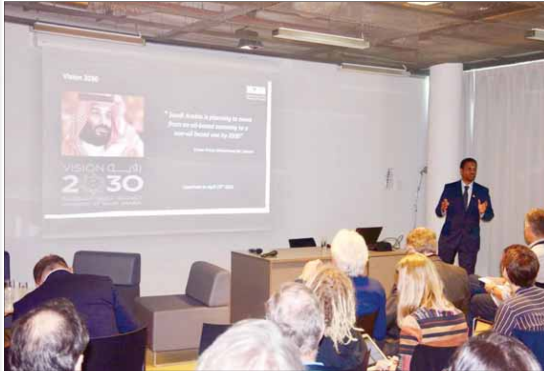
وفد وزارة الثقافة السعودية قدم خلال المؤتمر عرضاً تناول اهتمام بلاده بتطوير التراث الصناعي

مختلف الشرائح الاجتماعية، وذلك ضمن برنامج التراث الصناعي الذي أعلنه الأمير بدر بن عبد الله بن محمد بن فرحان وزير الثقافة، ويعنى بالتراث الصناعي تحت مظلة الوزارة وتأسيس الجمعية السعودية للحفاظ على التراث الصناعي.