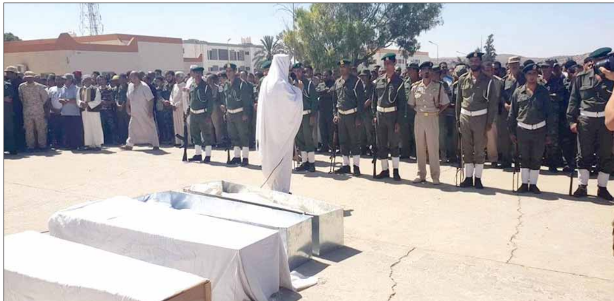
صورة وزعتها شعبة إعلام «الجيش الوطني» لتشييع جنازة قتلى ترهونة

تركيا التي تعتدي على أرضنا وتدعم الإرهاب وأدواته من المجرمين والمخربين والمهريين الذين يحاربون قيام دولة المؤسسات حتى يستمر الفساد والفوضى». وبعد ساعات فقط من تأكيد «الجيش الوطني» أن قاعدة الجفرة الجوية التابعة له في وسط البلاد لم تصب بأي أذى وأنه أحبط ما وصفه بمخطط قفطي - تركي لضربها، قالت عملية «بركان الغضب» التابعة لحكومة السراج مساء أول من أمس، في بيان لها بيان «نسور الجو» استهدفوا غرفة العمليات الرئيسية بالقاعدة والتي كان يشغلها ضباط أجانب من دولة إقليمية معتدية ودمرتها تدميراً كاملاً مع مقتل ضباطها الستة». ولم يفصح البيان عن هوية الدولة الأجنبية المعنية، لكنه أضاف «كما دمر سلاح الجو ثلاث منصات لإطلاق صواريخ أرض جو بقاعدة الجفرة كانت تهدد