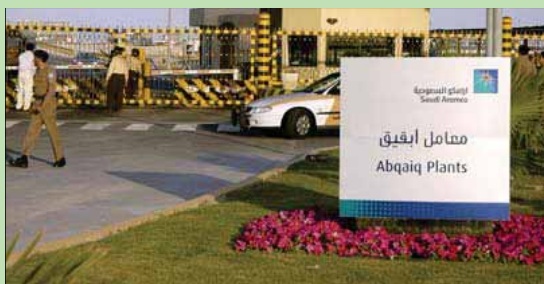
معامل بقيق

الأنابيب من الشرق إلى الغرب من 5 ملايين برميل يومياً إلى 6,5 مليون برميل يومياً في عام 2023. بالإضافة إلى ذلك تعد منشأة بقيق أكبر محطة لتثبيت النفط الخام في العالم، وتدير الشركة أربع محطات خام بسعة تخزين إجمالية قدرها 66,4 مليون برميل كما في 31 ديسمبر (كانون الأول) 2018؛ مما يساهم في المرونة التشغيلية ويدعم موثوقية العرض.