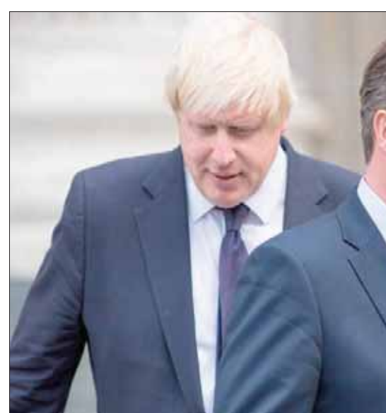
رئيس الوزراء البريطاني السابق ديفيد كاميرون (في الأمام) يوجه انتقادات لاذعة لرئيس الوزراء الحالي بوريس جونسون (في الخلف)

لوزراء بريطانيا على مدى 200 سنة عندما قاد المحافظين إلى سدة الحكم وعمره 43 سنة فقط، بحسب ما أشارت هيئة جونسون الحالية بأن بريطانيا ستخرج من الاتحاد باتفاق أو من دونه بحلول 31 أكتوبر (تشرين الأول) المقبل، على رغم أن البرلمان صوت قبل أيام على إرغام الحكومة على طلب تمديد مهلة الخروج من الاتحاد إذا لم يتم التوصل إلى اتفاق بحلول الشهر المقبل. وجاء تصويت البرلمان عشية سريان قرار تعليق عمله 5 أسابيع يطلب من حزب المحافظين صؤتوا مع المعارضة على قانون يلزم الحكومة بعدم الخروج من الاتحاد الأوروبي بلا اتفاق. وكان كاميرون أصغر رئيس