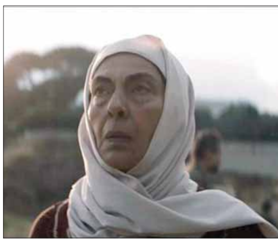
لقطة من فيلم «وفي اليوم السادس»

ويذا هذا التأثير واضحاً على وجه غالبية الحضور، وترجمه بعض المدعوين دموعاً أو تعليقات بصوت متهدج في نهاية عرض الفيلم. والسؤال الذي راود معظم أهل الصحافة والإعلام من بين الحضور هو كيف وافق نجوم الشاشة اللبنانية على المشاركة في فيلم قصير لن يكون مردوده عليهم مادياً ومعنوياً، كما هو مطلوب. ولياتي الجواب الشافي من الفنانين أنفسهم بأنهم أعجبوا بالقصة التي لامستهم بإنسانيتها عن قرب، فقررروا دخول هذه التجربة من دون تردد.