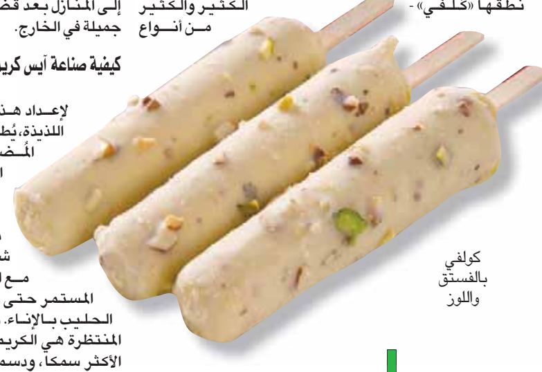
كولفي بالفستق واللوز

تشتق كلمة «كولفي» من اللغة الهندية ويقال إنها مرادفة لكلمة «الثلج». وعند نطقها «كُلفي» -