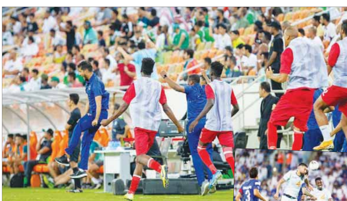
فرحة وحدوية بعد الهدف الأول في شباك الأهلي

مجموعة رائعة من الأسماء في جميع المراكز. وفي الجمعية، يبحث الفيصلي عن أول انتصاراته هذا الموسم بعد أن تعادل في مواجهتين على التوالي أمام الفيحاء والشباب. وفي الجهة المقابلة، يقبع الفتح في المركز قبل الأخير دون أي نقطة بعد تعرضه لخسارتين على التوالي من الشباب والنصر.