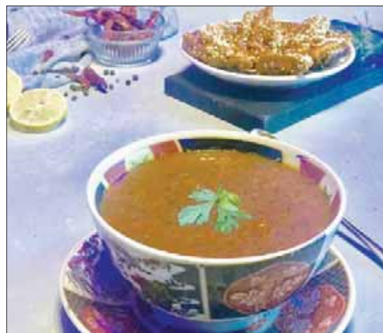
الحريرة والكسكسي من أشهر الأطباق في المطبخ المغربي

كسكس باللحم والخضار، أو بالدجاج والخضار، أو مدفون باللحم. كما تضم قائمة الطعام الأشهر تشكيلة من الطواجن المغربية الأصيلة، مثل طاجن خضار بربري الذي يعتمد على طاهيات مغربية محترقات، ما يجعل مأكولاته تنسم بجودة الطعم والمذاق. يأخذ «الكسكس» المغربي مكانته في قائمة طعام «ماروكان»، وإذا كانت سفرة يوم الجمعة في المغرب لا تخلو منه كونه أنيقة المائدة هناك، فإن المطعم يحافظ على هذا التقليد، حيث يعد بأحجام مختلفة، وبأكثر من طريقة، فهناك طاجن