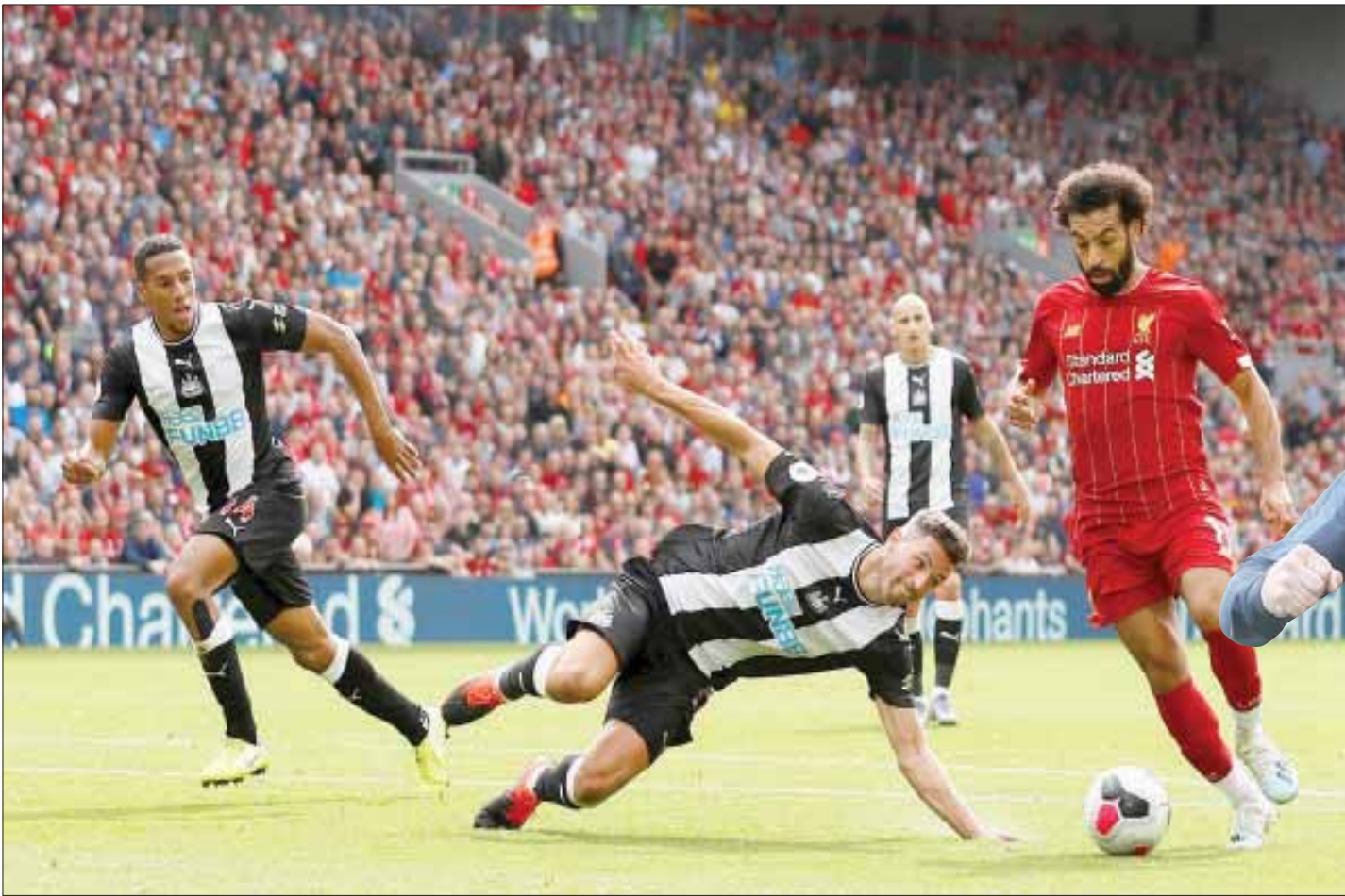
محمد صلاح في طريقه لاختتام ثلاثية ليفربول

وعلى استاد توتنهام، سجل المهاجم الكوري الجنوبي هيوغ مين سون هدفين في الدقيقتين 10 و23، واهتزت شبكات كريستال بالاس بهدف من النيران الصديقة حزره باتريك فان هولت عن طريق الخطأ في مرمرى فريقه في الدقيقة 21، وأضاف الأرجنتيني إيريك لامبلا الهدف الرابع لتوتنهام في الدقيقة 42، ليحسم الفوز المباراة تماماً في الشوط الأول. ورفع توتنهام رصيده إلى 8 نقاط، وتجمد رصيده كريستال بالاس عند 7 نقاط.