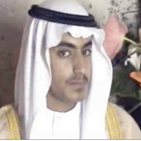
حمزة بن لادن خلال حفل زفافه

أفغانستان، وصياغة رسائل التنظيم. وصرحت واشنطن في فبراير (شباط) 2019 مكافأة تصل إلى مليون دولار لمن يقدم معلومات تتيح العثور على حمزة بن لادن. كما أضافت لجنة عقوبات الأمم المتحدة ضد القاعدة وتنظيم داعش، اسم حمزة أسامة محمد بن لادن «المولود في 9 مايو (أيار) 1989 في جدة، إلى لائحة ككشف مصدر مسؤول أن الأدلة الأميركية على وفاته «موقفة» للغة». وتعتبر الأمم المتحدة الحكومة الأميركية حمزة بن لادن عنصراً خطراً بإمكانه المشاركة في إعادة بناء المنظمة التي أضعفتها حرب واشنطن على الإرهاب بعد اعتداءات 11 سبتمبر 2001، ونافسها في