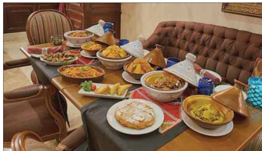
مائدة مغربية غنية بالأطباق التقليدية

كسكس باللحم والخضار، أو بالدجاج والخضار، أو مدفون باللحم. كما تضم قائمة الطعام الأشهر تشكيلة من الطواجن المغربية الأصيلة، مثل طاجن خضار بربري الذي يعتمد على طاهيات مغربية محترقات، ما يجعل مأكولاته تنسم بجودة الطعم والمذاق. يأخذ «الكسكس» المغربي مكانته في قائمة طعام «ماروكان»، وإذا كانت سفرة يوم الجمعة في المغرب لا تخلو منه كونه أنيقة المائدة هناك، فإن المطعم يحافظ على هذا التقليد، حيث يعد بأحجام مختلفة، وبأكثر من طريقة، فهناك طاجن