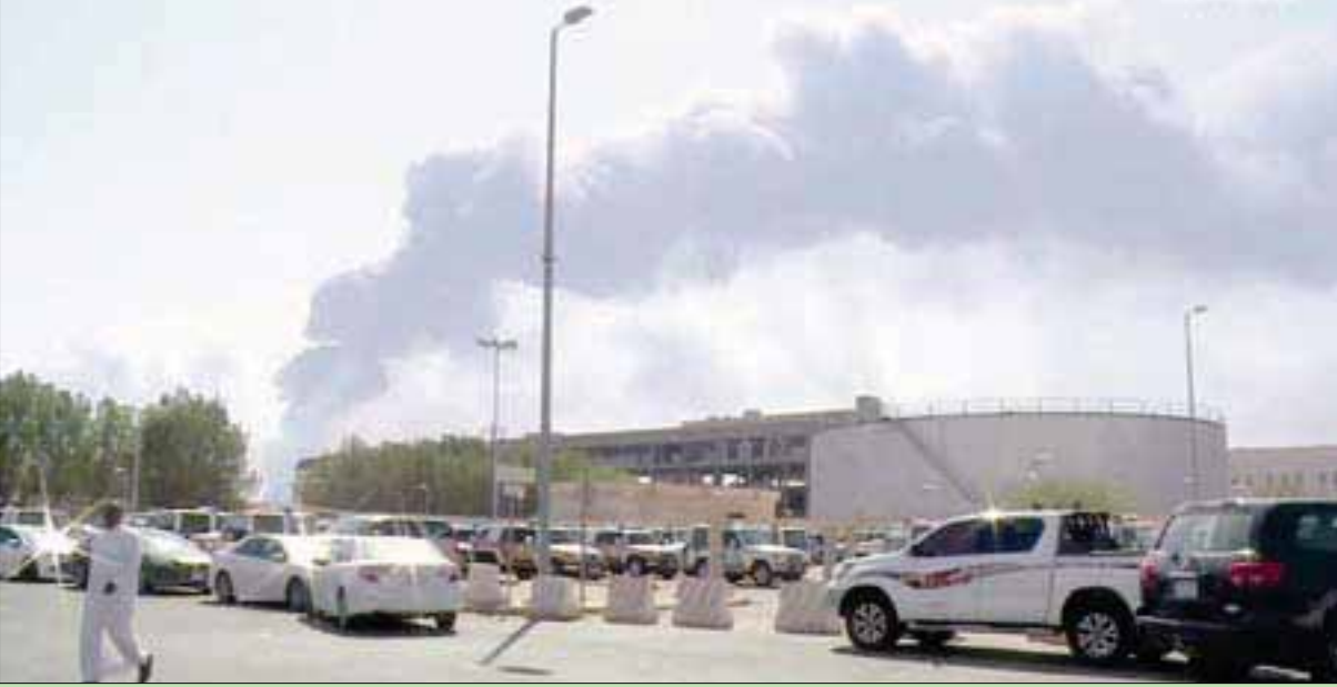
الحريق في منشأة بقيق النفطية كما بدا في مشاهد بثتها قناة «العربية» أمس