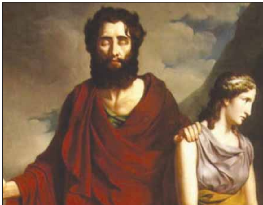
مشهد من مسرحية «أوديب ملكاً» لسوفوكلس

البيوناني كزنتزاكيس «العودة إلى جريكو» مثلما نراها في أفلام الكثير من مخرجي تلك المنطقة بالذات، من الروسي أندريه تاركوفسكي إلى اليوناني ثيو أنجلوبولس، إلى البولنديين رومان بولانسكي وكريستوف كيسلوفسكي. في أعمال كل هؤلاء نشاهد تحديات مطولة لعنسة كئيبة تسافر بحثاً عن خلود، تعرف مسبقاً أنه غير موجود. لكنها تواصل نحتها الصبور في الزمن، وتنتهي إلى أن الرحلة إلى أيتا أجمل من إيتاكا، كي لا ننسى ابن الإسكندرية كفاقي. بسالة وجنون الحرب الخاسرة سلفاً ضد عدم، نراها في كل فن عظيم، لكن أحداً لا تتيسر له رؤية ذلك العدو مهما اطل التحديق.