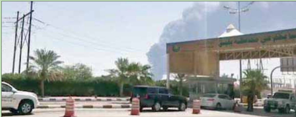
جانب من معمل تكرير بقيق كما بدا في أعقاب السيطرة على الحريق أمس

وهذا هو الهجوم الإرهابي الثاني الذي يتعرض له مواقع «أرامكو» النفطية في بقيق؛ حيث سبق أن تعرضت لهجوم بسيارة مفخخة تبناه تنظيم «القاعدة» في 24 فبراير (شباط) 2006. ولم يتمكن المهاجمان اللذان قتلوا في الهجوم من الدخول إلى معمل التكرير، واستشهد رجلا أمن في الحادث.