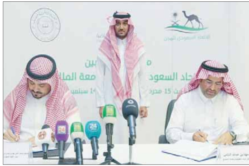
لحظة توقيع اتفاقية التعاون بين اتحاد الهجن وجامعة الملك فيصل بالأحساء وبيدو الأمير عبد العزيز الفيصل

والمشاركة في المراكز البحثية، وتطوير وتحديث البرامج التعليمية والتدريبية والتشغيلية في مجال رياضة سباقات الهجن، والاستفادة من مصادر التعلم لدى جامعة الطائف والاتحاد السعودي للهجن، إضافة للاستفادة من الكفاءات من منسوبي جامعة الطائف والاتحاد السعودي للهجن وتسهيل التعاون بينها، وتمكين الطلبة من حضور الورش والدورات التي يقيمها الاتحاد، وإتاحة الفرصة لهم للمشاركة في فعالياته ومسابقاته، والاستفادة من المراكز الإعلامية التابعة للاتحاد وتجهيزاتها، مع استقبال الوفود من خارج المملكة، وتعريفها بأثار الطائف ومعالمها، والتسويق الإعلامي للاتحاد، وترجمة المحتوى الإعلامي له، وتوظيف التقنيات الحديثة للعدول قاعدة بيانات بسلايات الهجن، وتوصيفها، وتحديد السلالات النادرة، وإكثارها. وأكد الأمير فهد بن جلوي أن من شأن مذكرة التفاهم المساهمة في إنجاح الفعاليات المختلفة لسباقات الهجن، خصوصاً أن جامعة الطائف لها إسهامات مقدرة ظهرت جلياً في السنتين الماضيتين لمهرجان الهجن، وشراكة طلابها في تغطية فعاليات نسخة الحالية بتميز. لافتاً سموه النظر إلى أن الفائدة المتبادلة ستكون كبيرة لكلا الطرفين.