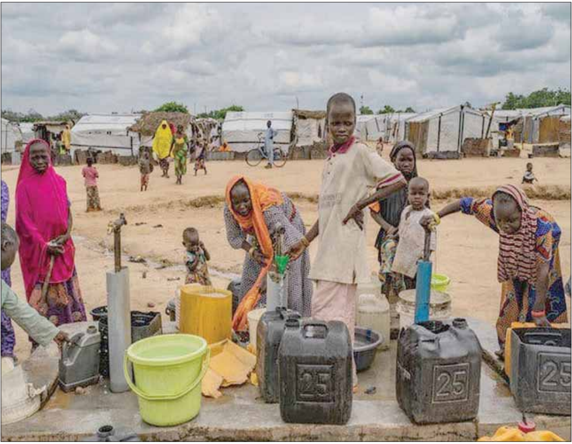
سكان مخيم كوندوغا الذي يستضيف عشرات الآلاف من الأشخاص الفارين من الحرب مع «بوكو حرام» (نيويورك تايمز)

من أصل عشر مناطق في ولاية برونو النيجيرية الشمالية على مقربة من بحيرة تشاد، وذلك وفقاً للمحللين الأمنيين وأحد المسؤولين الفيدراليين في البلاد. وهم يواصلون شن وتنفيذ الهجمات الإرهابية بصفة شبه يومية، بما في ذلك إطلاق مخفف للنيرون خلال الأسبوع الماضي على مكتب حاكم ولاية برونو. عمل بالوكالة إلى السكان الذين يعيشون في القرى الخاضعة لسيطرة الجماعة الإرهابية، مثل قرية كوندوغا، فإن هزيمة جماعة «بوكو حرام» تبدو كالمطل بعيد المنال، إذ أسفر الهجوم الانتحاري الذي وقع يوم 17 يونيو (حزيران) الماضي، وأصاب عبدول ورفاقه الصغار بالندبات الغائرة في أجسامهم الضعيفة (حُجج اسم الطفل الصغير عن النشر حماية له ولاسرته من الانقمام، عن مصرع 30 مواطناً، من بينهم ثمانية أطفال.