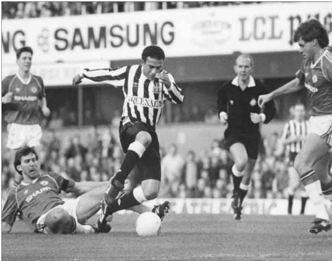
ميراندينها يمر من لاعب مانشستر يونايتد براين روبسون على ملعب نيوكاسل في 26 نوفمبر عام 1988

لقد تغير مشهد كرة القدم الإنجليزية في الثلاثين عاماً التي تلت رحيل ميراندينها عن نيوكاسل، وقبل بداية الدوري الإنجليزي الممتاز لعب خمسة برازيليين - ألبيسون، وفابيانو، وروبرتو فيرمينو، وإيدرسون، وغابرييل جيسوس - على ملعب نيوكاسل في كأس الدرع الخيرية والتي انتهت بفوز مانشستر سيتي على ليفربول بركلات الترجيح بعد نهاية الوقت الأصلي للمباراة بالتعادل بهدف لكل فريق ويعد جوليتون لاعبا من بين 24 برازيلياً يلعبون في الدوري الإنجليزي الممتاز هذا الموسم، ويحصلون جميعاً على أجر جيد.