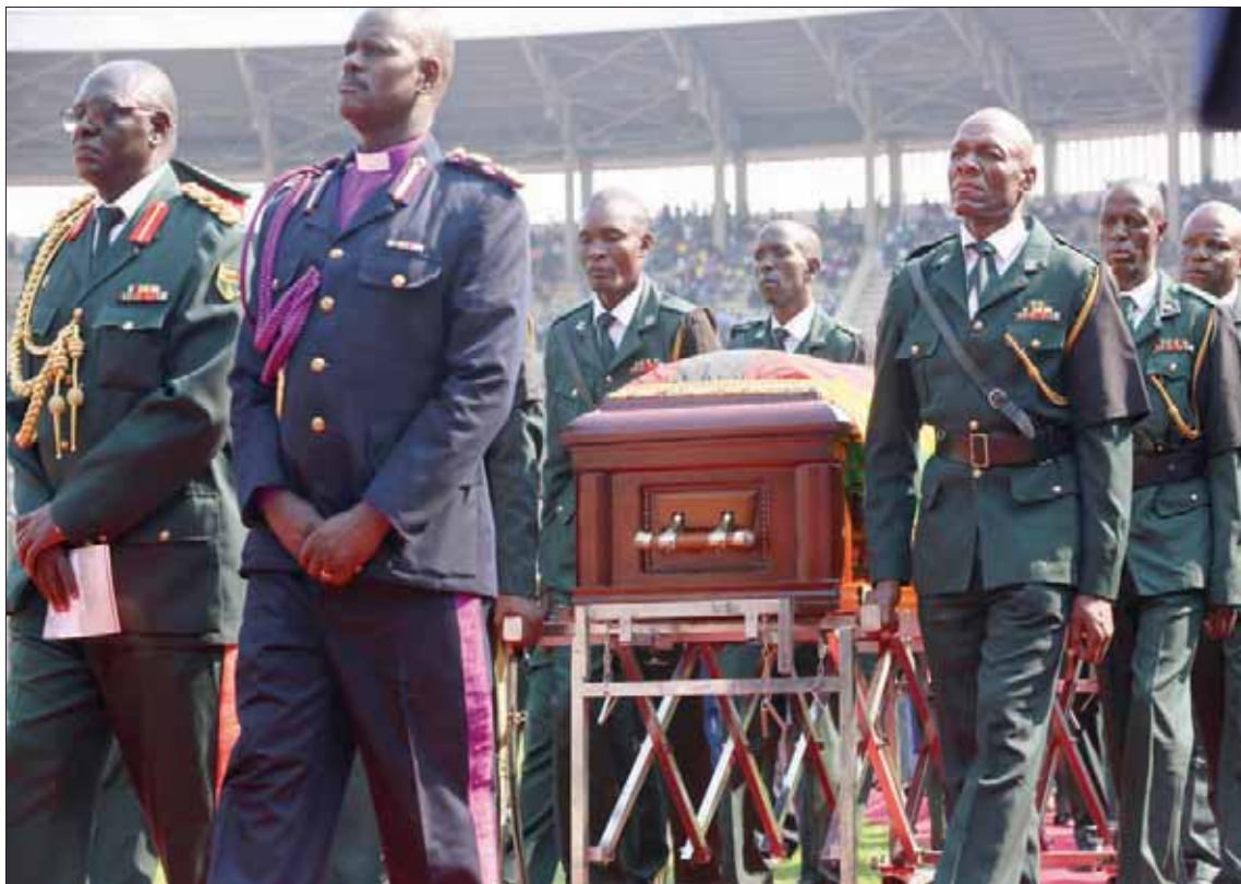
جثمان رئيس زيمبابوي السابق محمولاً إلى مثواه الأخير

● وُلد روبرت غابرييل موغابي في 21 فبراير (شباط) 1924، في بعثة التبشير الكاثوليكية في كوتاما (وسط)، وقد وُصف بأنه طفل وحيد ومخاير يراقب المشاهدة وهو بقرا. وبينما كانت تراهوه فكرة أن يصبح قسا، دخل سلك التعليم بعدما أفرته الماركسية، اكتشف موغابي السياسة في جامعة «فور هاري» التي كانت المؤسسة الوحيدة المفتوحة للسود في جنوب أفريقيا في نظام الفصل العنصري. في 1960 التحق بالانضال ضد الحكم الأبيض والعنصري في روديسيا. وقد أوقف بعد أربع سنوات وأُضفي في السجن عشر سنوات جعلته يتعمر بمرارة كبيرة. فقد رفضت السلطات السماح له بالمشاركة في تشييع ابنه البالغ من العمر 4 سنوات درجة كبيرة.