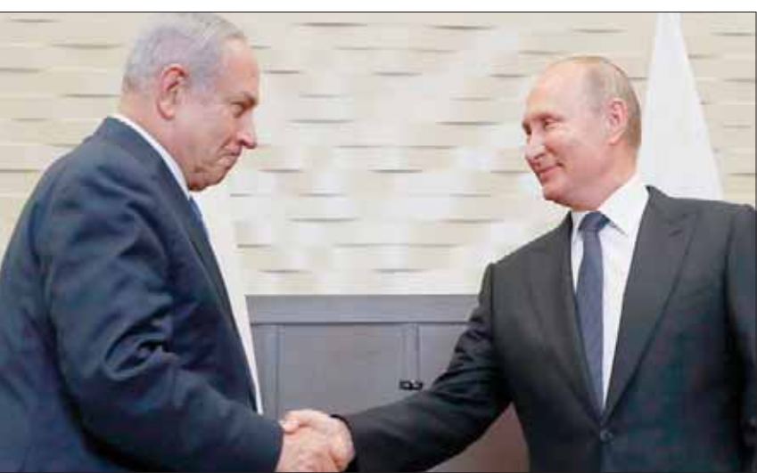
بوتين مستقبلاً نتنيهاو... دعم انتخابي وخطوط حمراء

موسكو، رائد جبر أثارت نتائج المحادثات التي أجراها الرئيس فلاديمير بوتين، مع رئيس الوزراء الإسرائيلي بنيامين نتنياهو، في سوتشي، نقاشات حول مصير التفاهات الروسية - الإسرائيلية في سوريا، وانعكاسات التطورات الجارية على صعيد تعزيز العلاقات الثنائية على التنسيق المستقبلي بين موسكو وتل أبيب على المستوى الإقليمي عموماً. كان لافتاً أن الطرفين أبديا ارتياحاً لمضمون ونتائج المحادثات، بعد جلسة النقاشات الموسعة التي تأخرت عن موعدتها المقرر مسبقاً لمدة ثلاث ساعات، استغلها نتنياهو في إجراء مفاوضات تفصيلية مع وزير الدفاع الروسي سيرغي شويغو، قبل أن يصل بوتين إلى مكان الاجتماع ويبدأ اللقاء الذي استمر بدوره ثلاث ساعات أخرى، ما عكس السحر على إجراء المحادثات والحرص وتفصيلية للملفات المطروحة. كما أن مستوى إجماع الحضور من الجانبين دل على إيجاب الاهتمام الأكبر للملف السوري، وعلى التنسيق الميداني العملي، وليس فقط التنسيق السياسي. في حين أن الملفات الأخرى المطروحة تم التعامل