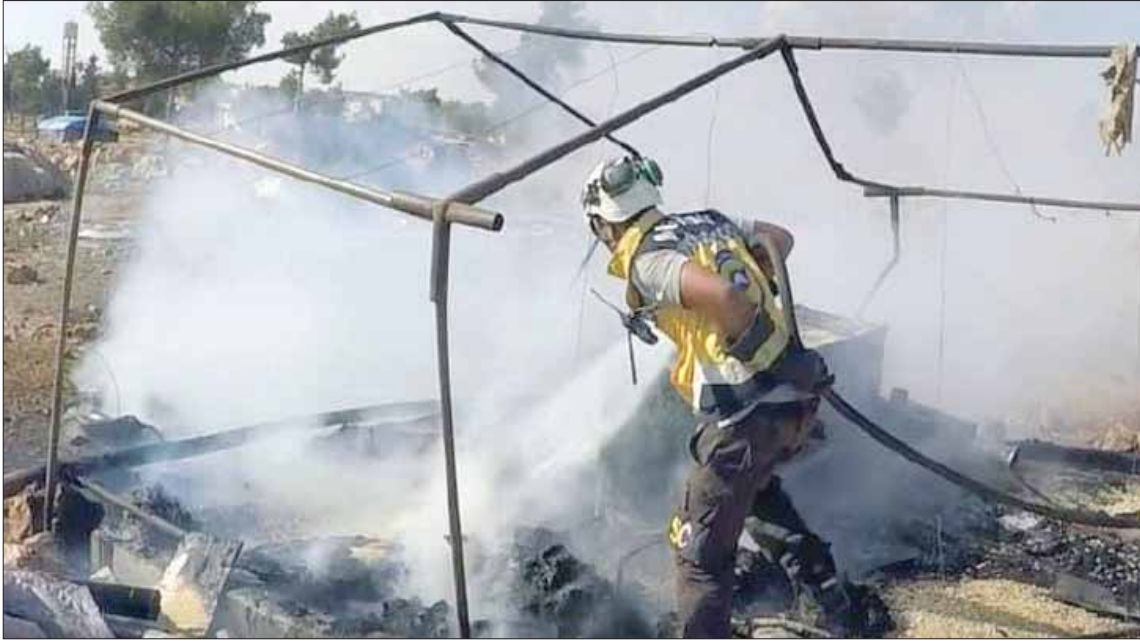
احتراق خيم النازحين في بيتين بريف إدلب بعد قصف الطيران الحربي الجمعة

عادت قوات النظام مجدداً لفتح معبر أبو الظهور بريف إدلب الشرقي، أمس، وذلك بغية «عبور المدنيين الراغبين بالخروج من مناطق تحرير الشام والفصائل نحو مناطقها»، إلا أن المعبر كعادته لم يشهد أي توجه للمدنيين نحو مناطق النظام، بحسب المرصد السوري لحقوق الإنسان بالترام مع عودة القصف الجوي والمزم بشكل ملحوظ إلى منطقة «خض التصعيد».