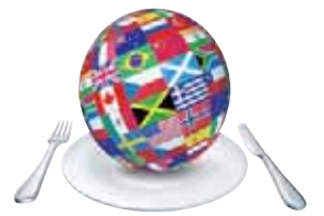
نيودلهي، براكريتي غوبتا