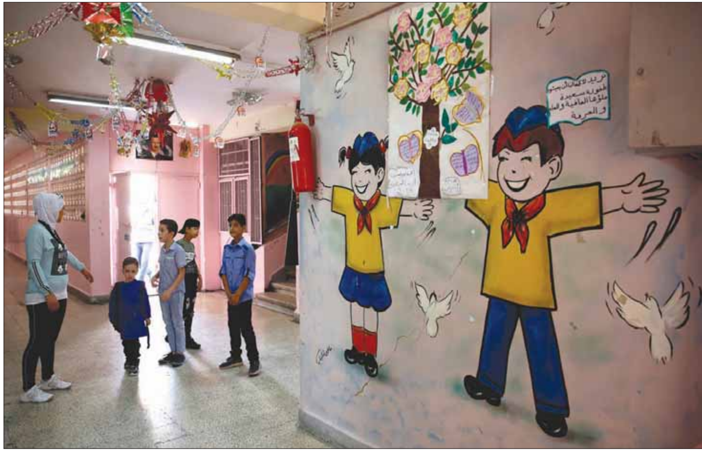
أطفال سوريون في اليوم الأول للفصل الدراسي أمس

فات بعضهم الآخر ما يصل إلى سبع سنوات من التعليم ما صعب عليهم اللحاق بالركب. وترافق بدء العام الدراسي الجديد مع تدهور حاد في سعر صرف الليرة السورية أمام الدولار الأميركي، ووصوله إلى أكثر من 640 ليرة، بعد أن كان قبل 10 أيام ما بين 600 - 610 ما أدى إلى تحطيم كبير في أسعار عموم المستلزمات المعيشية، زاد من صعوبة الحياة أكثر على الأسر. ولوحظ في الأسواق تضاعف أسعار المستلزمات المدرسية عما كانت عليه في العام الماضي، ووصل سعر الحقيبة ذات الجودة المتوسطة لمرحلة التعليم الأساسي إلى تسعة آلاف ليرة، بعد أن كان في العام الماضي يقارب خمسة آلاف، بينما يبلغ سعر القمصين سبعة آلاف بعد أن كان بأربعة آلاف. وتصل تكلفة تأمين مستلزمات الطالب الواحد في مرحلة التعليم الأساسي، ما بين ثياب وحذاء حقيقي وقمصان وحقائب، وأكثر من 100 دولار، على حين لا يتجاوز المرتب الشهري للموظف 800 دولاراً. وما زاد من بله طين صعوبة الحياة المعيشية للأهالي هو تراقف بدء العام الدراسي الجديد مع موسم «المونة»، الذي يحتاج لمبالغ مالية كبيرة، وكذلك قدومه بعد أيام قليلة من انتهاء عيد الأضحي المبارك الذي يحتاج أيضاً لمصاريف كثيرة.