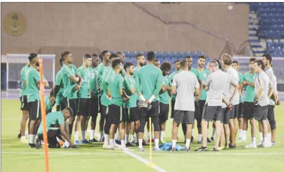
لاعبو المنتخب السعودي خلال أول تدريب أمس

ويذكر أن تدريبات المنتخب السعودي لن تستقر في ملعب الأمير محمد بن فهد بالدمام، بل سيتم نقل عدد منها إلى ملعب مدينة الأمير سعود بن جلوي الرياضية بالرياض، على أن تقام ودية مالي يوم الخميس المقبل في الدمام.