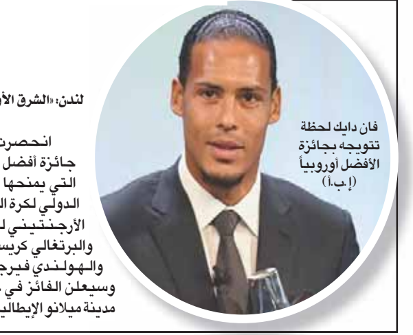
فان دايك لحظة تتويجه بجائزة الأفضل أوروبا (إبأ)

فان دايك ينافس ميسي ورونالدو مجدداً على لقب الأفضل بالعالم أوروبا، وساهم في قيادته لاحتلال المركز الثاني في الدوري الإنجليزي الممتاز بفارق نقطة فقط خلف مانشستر سيتي. كما اختير أفضل لاعب في الدوري المحلي موسم 2018 - 2019، ليصبح أول مدافع يفوز بها منذ جون ثيري مع تشيلسي عام 2005. كما أحرز الهولندي لقب كأس السوبر الأوروبية مع ليفربول على حساب تشيلسي بركلات الترجيح، إضافة إلى قيادته منتخب هولندا ليكون صيف بطل النسخة الأولى من دوري الأمم الأوروبية. وستنافس ثلاث لاعبات على لقب الأفضل وهن الأميركية ميجان رايبيني وواليكس مورغان اللتان توجتا بلقب مونديال فرنسا 2019 هذا الصيف، والإنجليزية لوسي برونز لاعبة نادي ليون الفرنسي. ويتنافس حارسا المنتخب البرازيلي اليسون بيكر (ليفربول)، وإيدرسون (مانشستر سيتي)،