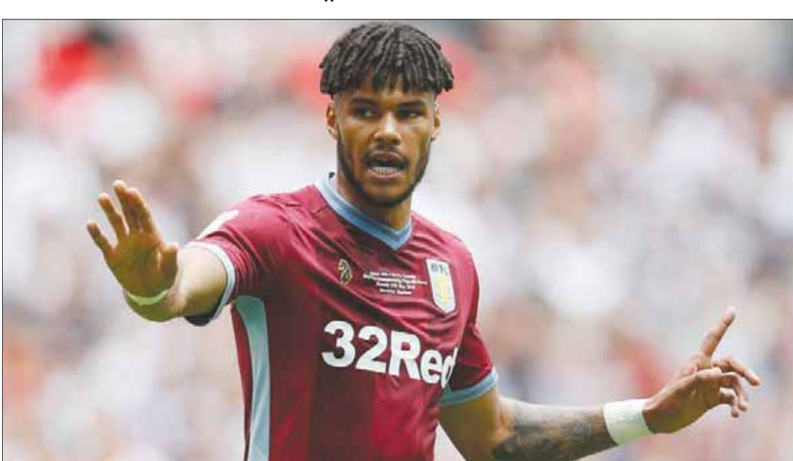
مينغز سينضم لمنتخب إنجلترا بعد ظهوره المميز مع أستون فيلا

المباريات لأسباب فنية. ونتيجة لشعوره بخيبة أمل وإحباط بسبب ابتعاده عن المشاركة في المباريات، ضغط مينغز بشدة من أجل الرحيل عن النادي على سبيل الإعارة في فترة الانتقالات الشتوية، وتحققت أمنية في اليوم الأخير