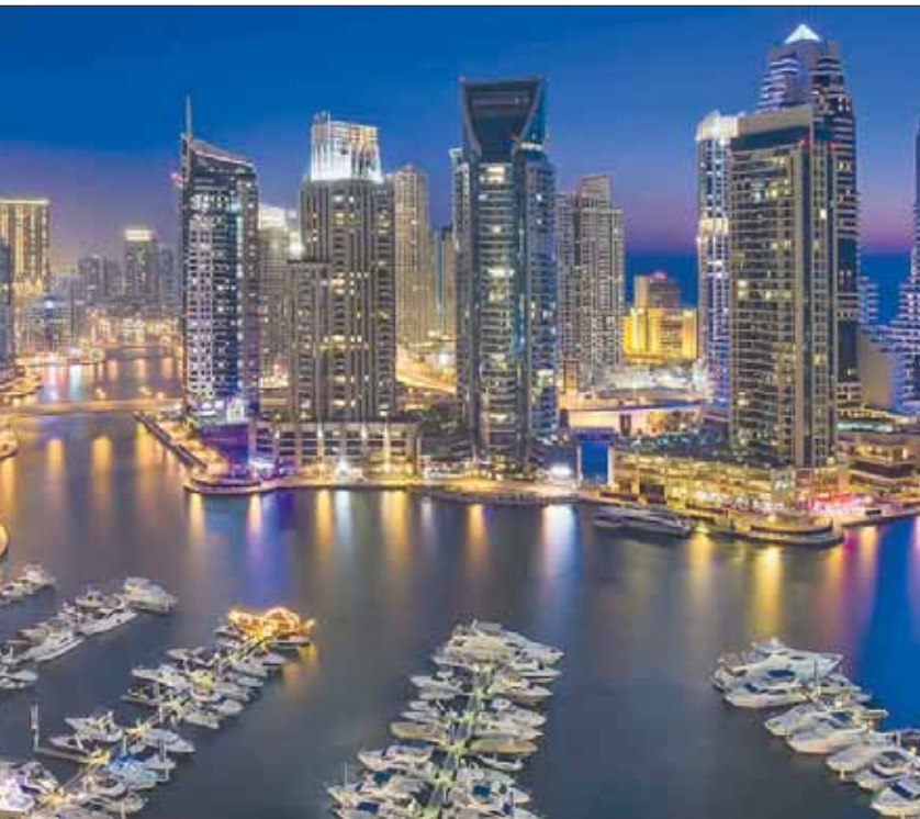
لجنة التنظيم العقاري بدبي ستقوم بتقييم الوضع الراهن للقطاع بمختلف مستوياته وفئاته

واحدة دبي للسيليكون»، و«دبي الجنوب»، و«مركز دبي للسلع المتعددة».