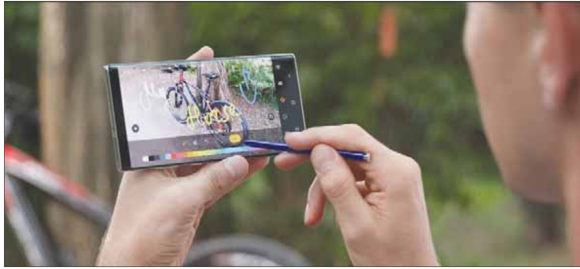
يدعم القلم الذكي وظائف متقدمة عديدة

عرض الفيديو، لينقل ذلك المقطع ويحوّله إلى صورة متحركة بامتداد GIF وبشاركتها مع الآخرين. ويمكن أيضاً الرسم فوق الفيديو لتقديم الأفكار الإبداعية للآخرين أو مشاركة الملاحظات معهم فوق الصورة. ويمكن تدوين الملاحظات فور إخراج القلم من مكانه حتى لو كان الهاتف مغلقاً، حيث تبلغ 7 نانومتر لرفع مستويات القفل ليفهم الهاتف أن المستخدم يرغب في كتابة ملاحظة ما. ويمكن تفعيل «مساعدة غوغل» الصوتي بمجرد الضغط المطول على زر القلم لتفعيل المساعد وبدء استماعه للاوامر. ويمكن تخصيص هذه الإيماءات من قائمة إعدادات القلم. ويقدم الهاتف ميزة جديدة اسمها «إيه إن دول» AR Doodle تسمح برسوم فلاشز خاصة باستخدام يمكن استخدامها في تطبيق الكاميرا لإضافتها إلى العناصر المرغوبة، وهي تستطيع تعقب الأوجه. وتدعم هذه الميزة الرسم ثلاثي الأبعاد، أي أنها تشمل رسم الفلاشز بعمق أثناء تحرك المستخدم نحو العنصر أو بعيداً عنه. ويمكن اختيار ترجمة جمل معينة في صفحة ما من لغة لأخرى بمجرد تحديد الكلمات المرغوبة بالفلم، أو يمكن توجيه الكاميرا نحو لوحة إرشادية واستخدام القلم لتحديد الكلمات المرغوب ترجمتها (تدعم النظام الترجمة إلى اللغة العربية)، إلى جانب قدرته على تكبير حجم المناطق المرغوبة على الشاشة، والتعرف على أن المستخدم ترك القلم بعيداً عنه وتعيينه بذلك.