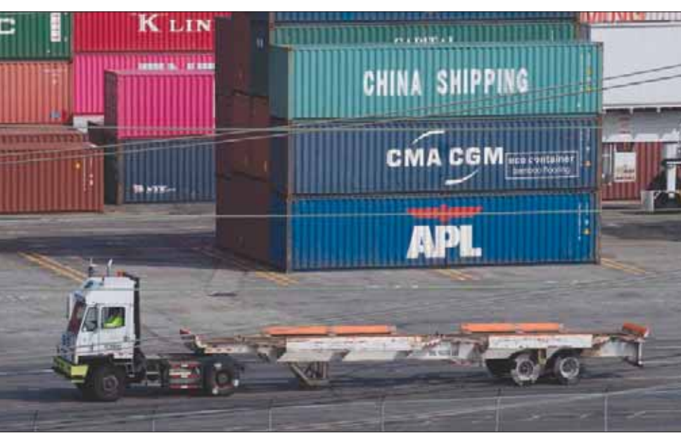
شاحنة تمر أمام حاويات في ميناء لوس أنجليس عقب بدء سريان التعريفات الغائبة الأميركية الجديدة ضد الصين.

شراء المنتجات الصينية بالولايات المتحدة، وأن بعض تلك الشركات قد تتحمل تلك الزيادة دون تمريرها للمستهلكين. وكان ترمب قد ذكر أن تيم كوك الرئيس التنفيذي لشركة آبل الأميركية قد أشار بصورة غير معلنة إلى أن الرسوم الأميركية على السلع الصينية المجمعة تركزت أكثر غير عادل على الشركة التكنولوجية العملاقة، التي تتخذ من ولاية كاليفورنيا مقراً لها، لأن منافستها الرئيسية، شركة سامسونج، تنفذ جميع عملياتها التصنيعية في كوريا الجنوبية ولا تتحمل في ذلك صراخ. وأشار مراقبون إلى أنه من المتوقع فرض المزيد من الرسوم حيث تنوي إدارة الرئيس ترمب يوم 15 ديسمبر (كانون الأول) المقبل فرض حزمة ثانية تشمل 15 في المائة من الرسوم الجمركية، وهذه المرة على واردات صينية تقدر قيمتها بـ160 مليار دولار.. وفي حالة تنفيذ ذلك فإن جميع واردات الصين تكون قد ضلعت للرسوم بما في ذلك جميع المنتجات الأساسية لشركة آبل. ويذكر أن الصين على الجانب الآخر بدأت فرض مزيد من الرسوم على البضائع الأميركية المستوردة اعتباراً من يوم الأحد. ويأتي هذا على الرغم مما كانت أملت إليه الصين في الأسبوع الماضي من سعيها لوضع نهاية هادئة للحرب التجارية مع الولايات المتحدة.