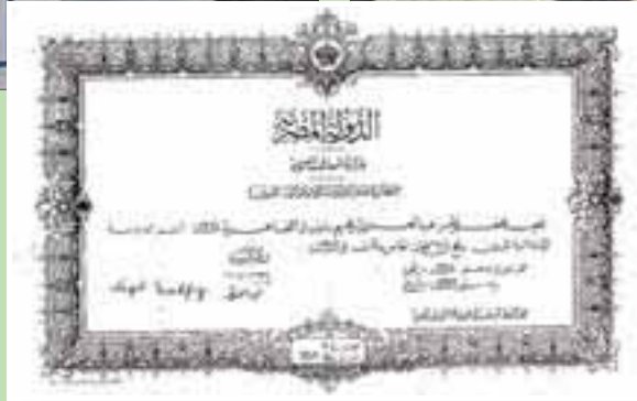
شهادة نجيب محفوظ الابتدائية عام 1925

جانب من معرض امتحان دراسة الشهادة الثانوية ل محفوظ