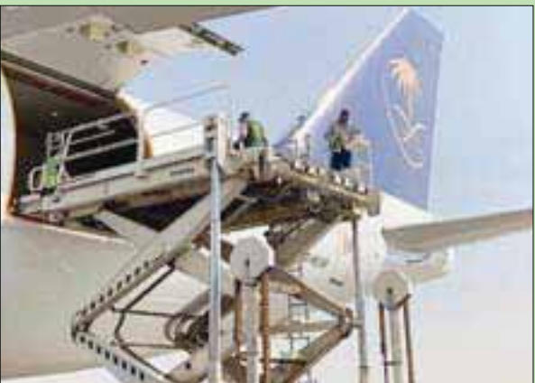
طائرة شحن سعودية تحمل مواد إيوائية وطبية إلى السودان أمس