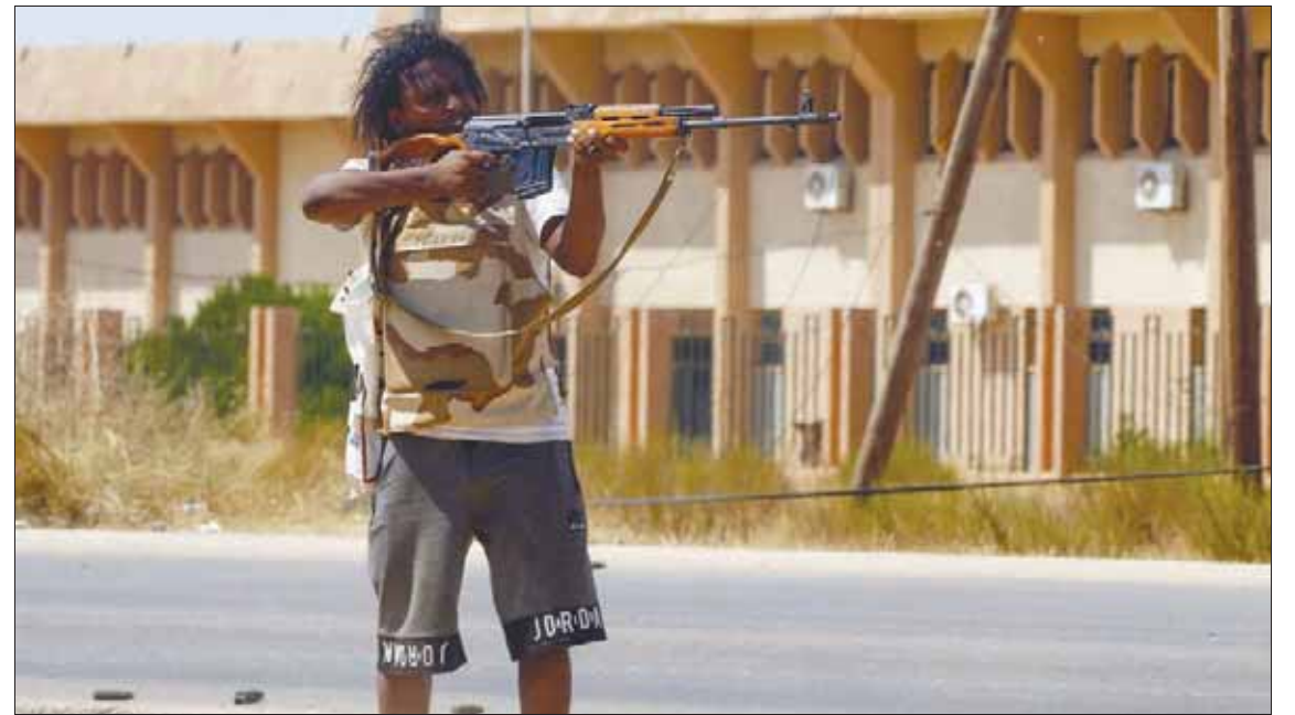
مقاتل من القوات الموالية لحكومة «الوفاق» خلال مواجهات مع الجيش الوطني جنوب طرابلس أواخر الشهر الماضي

القاهرة: خالد محمود وسوسن أبو حسين في حين اتهم الجيش الليبي بقيادة المشير خليفة حفتر «الميليشيات المسلحة» الموالية لحكومة «الوفاق» برئاسة فايز السراج، باستهداف «المراقف المدنية» في العاصمة طرابلس بما في ذلك قصف مطار معيثة الدولية، أول من أمس، نوه غسان سلامة رئيس بعثة الأمم المتحدة لدى ليبيا خلال لقائه في القاهرة أمس مع الأمين العام للجامعة العربية أحمد أبو الغيط، بضرورة وجود «دور للجامعة في إيجاد حل سياسي دائم بعيد الاستقرار إلى ليبيا».