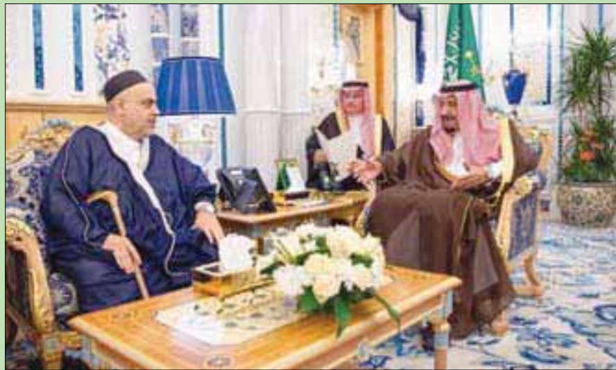
خادم الحرمين الشريفين لدى استقباله الدكتور شكر الله باشازاده رئيس إدارة مسلمي القوقاز في قصر السلام بجدة أمس

جدة: «الشرق الأوسط» استقبل خادم الحرمين الشريفين الملك سلمان بن عبد العزيز، في مكتبه بقصر السلام في جدة أمس (الإثنين)، الدكتور شكر الله باشازاده، رئيس إدارة مسلمي القوقاز. ونقل مصدر إدارة مسلمي القوقاز، في بداية الاستقبال لخادم الحرمين الشريفين