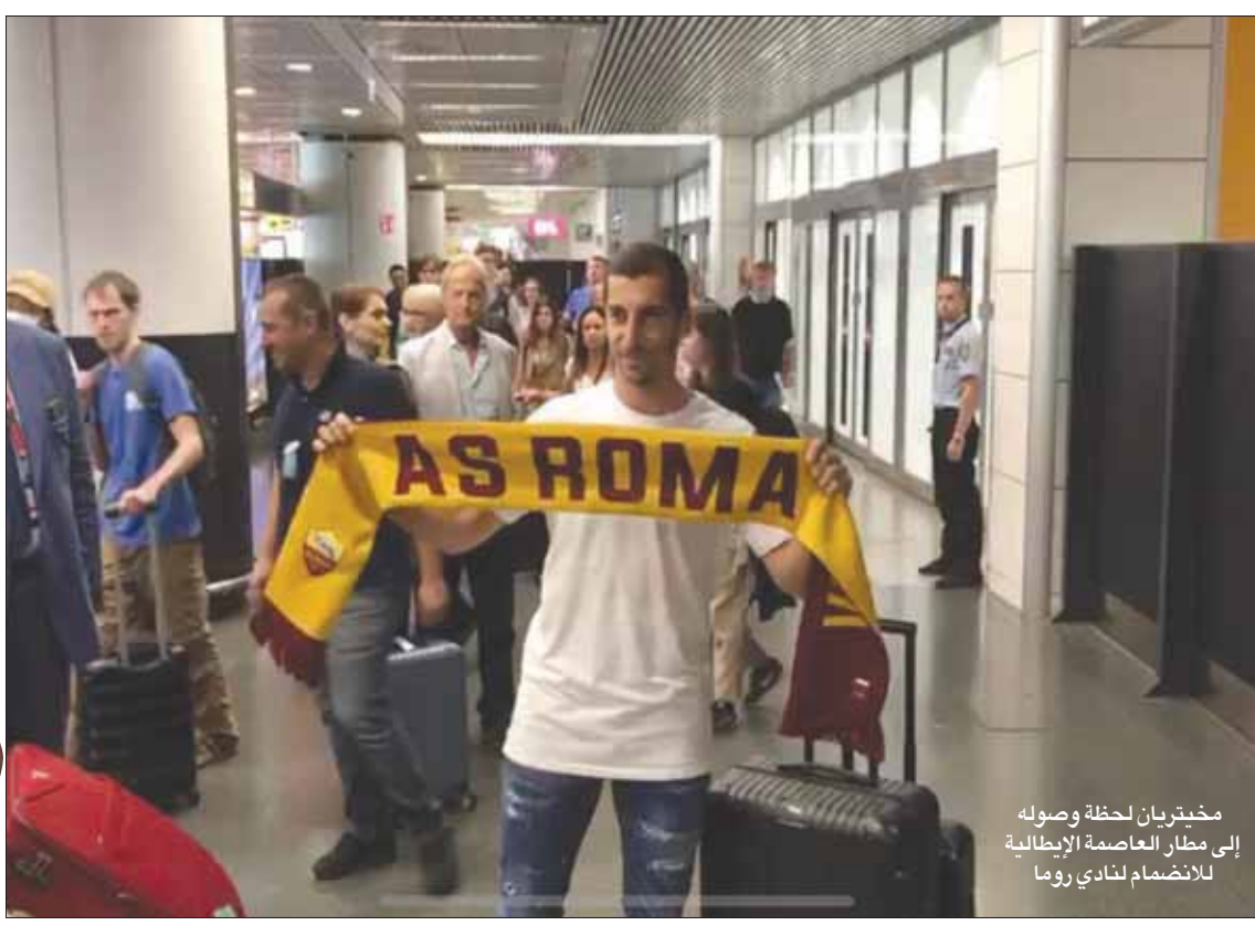
مختيرين لحظة وصوله إلى مطار العاصمة الإيطالية للانضمام لنادي روما

إلى عدم إنفاق الأندية أكثر من 8,5 مليون يورو (بإضافة إليها راتب اللاعب)، وهو مبلغ زهيد للاعب على هذا المستوى. جانب آخر باتت الأندية تتطلع إليه مع الاعتماد المتزايد على نظام الإعارة، هو البقاء ضمن متطلبات قواعد اللعب المالي النظيف التي يفرضها الاتحاد الأوروبي (وييفا)، والتي تهدف بشكل أساسي لكون انتقال الأندية تم بصفة مزروجة تقوم على استعارته لموسم واحد، قبل التعاقد معه بشكل ثابت، في عملية قدرت تكلفتها بـ 180 مليون يورو. ورغم ذلك، فتح الاتحاد الأوروبي تحقيقاً بشأن احتمال مخالفة النادي لقواعد اللعب المالي النظيف. سبب آخر بات يدفع الأندية إلى اعتماد نظام الإعارة، وهو تحقيق أعلى عائد ممكن على بيع لاعبيهم إلى طرف آخر. فعلى سبيل المثال، انضم الأرجنتيني جيوفاني لوسيلو بشكل نهائي إلى ريال بيتش الإسباني هذا الصيف، لكن النادي «باعه» إلى توتنهام الإنجليزي عبر الإعارة لموسم لقاء 16 مليون يورو، والانتقال النهائي في صيف العام المقبل. لكن بيتش يستفيد من هذه القيمة عبر الحد من الجدل المالي الذي يحصل عليه نادي لوسيلو السابق، باريس سان جيرمان الفرنسي، وذلك من خلال خفض القيمة الفعلية للإعارة، بما أن مبلغ الـ 16 مليون يورو سيخصم من القيمة النهائية لصفة البيع في صيف 2020.