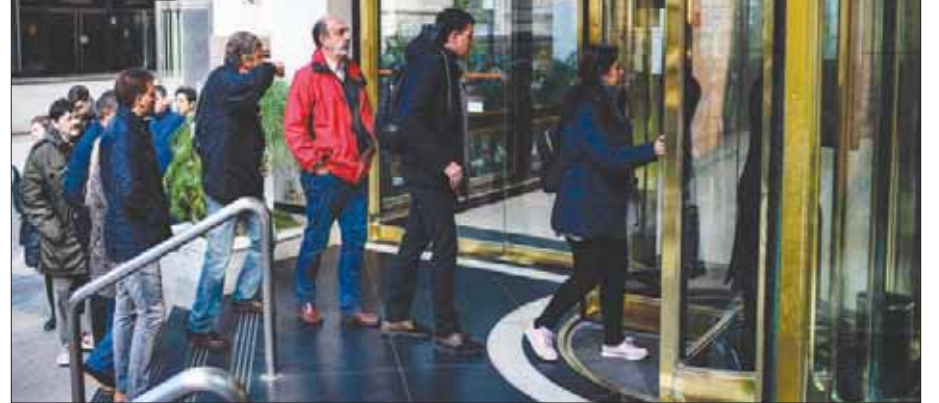
شهدت البنوك المحلية في الأرجنتين تراجيحاً شديداً أسس بعد ساعات من الإعلان عن قيود للعملات الأجنبية

عقب ساعات من إعلان الأرجنتين فرض قيود على الصرف بالعملات الأجنبية، في محاولة لوقف هروب رؤوس الأموال عقب أزمة اقتصادية حادة تشهدها البلاد منذ منتصف الشهر الماضي، شهدت الأصول المالية في الأرجنتين خسائر حادة خلال تعاملات صباح أمس، نتيجة لتلك القيود التي أشارت مخاوف المستثمرين، بدلاً من بت الطمانينة حول قدرة البلاد على تخطي الأزمة. وتراجعت السندات الحكومية المقومة بالدولار، التي يحين موعد استحقاقها في 2028 إلى مستوى 36,58 سنت لكل دولار، وهو أدنى الإطلاق، وفقاً لبيانات «فيدينتيف»، بالإضافة إلى خسائر للسندات ذات أجل استحقاق 5 و20 عاماً، حسب وكالة «يوتيرز»، فيما ارتفعت علاوة المخاطر التي يطلبها المستثمرون من أجل الاحتفاظ بسندات الأرجنتين إلى 2534 نقطة أساس أعلى من عوائد سندات الخزنة الأميركية، وهو أعلى مستوى منذ أزمة الأفلاس في عام 2001. وفي سوق الأسهم، تراجعت أسهم الشركات المالية الأرجنتينية خلال التعاملات، حيث هبط سهم