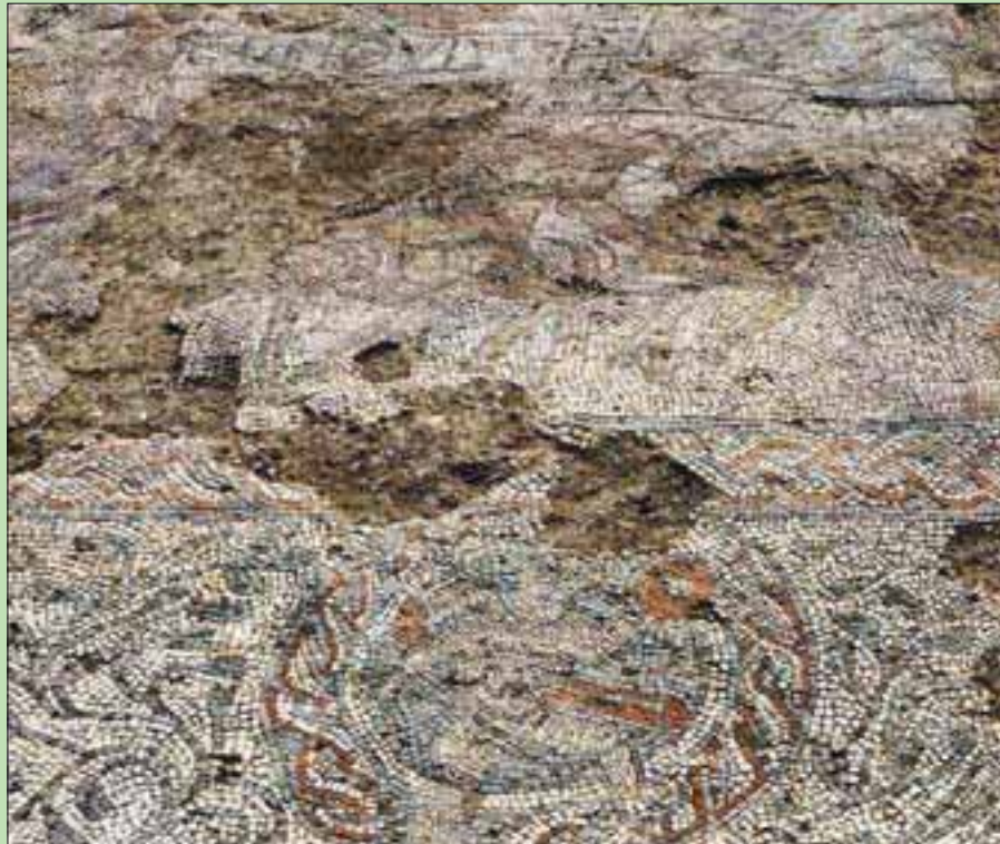
فسيفساء، عثر عليها في بوكسفورد