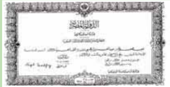
شهادة نجيب محفوظ الابتدائية عام 1925

عام 1950، قبل أن ينتقل إلى وزارة الثقافة والإرشاد القومي، ويعمل مديراً لمكتب الوزير. كما يبرز المعرض قرار تعيينه رئيساً للرقابة على المصنفات الفنية في