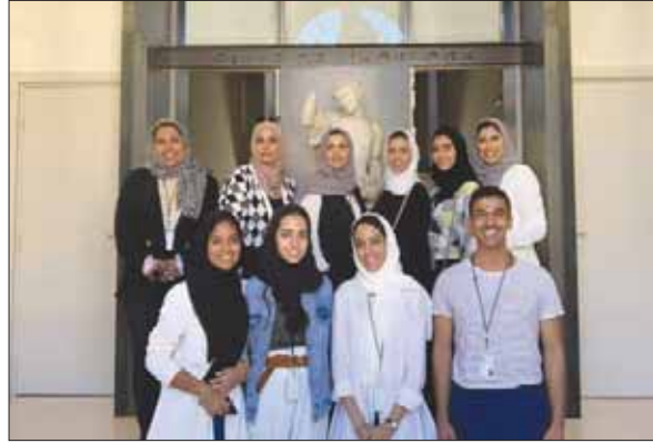
عدد من الشباب السعودي في البرنامج التدريبي

لا يمكن أن تنتشر ظاهرة الاعتذار ما لم نمارس ذلك في البيت أولاً ثم المدرسة، والعمل، وجميع وسائل الإعلام والتواصل الاجتماعي، وطواعية لا مضطرين أو مرغمين. ولذا فإنني في أحيان كثيرة، وكثيرين مثلني، نتعمد الاعتذار بصورة مسموعة أمام أطفالنا عما بدر منا من خطأ أو اجتهاد أو كلمة غير موفقة. وكلما ارتفع منصبك ومكانتك في المجتمع زادت الحاجة إلى اعتذارك. فهناك من يدمر شركة أو مؤسسة عامة أو فريقاً رياضياً، ولكن ما إن يتحلى بشجاعة الاعتذار فإنه سرعان ما يسحب البساط من تحت أقدام خصومه. أما أكثر جريمة فهي أن تدمر شعبك أو تضر وطنك ورموزه، ولا تقدم على كلمة اعتذار.