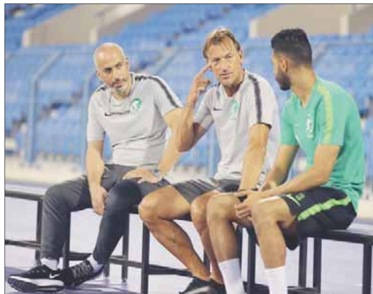
هيرفي رينارد

قال الكويكي: «بكل تأكيد الموسم بدأ وقد استعدنا له جيداً، وسنسعى بكل ما نملك أن نقدم الأفضل للمنتخب السعودي في الفترة المقبلة»، مبيناً أن الأجواء الرياضية ستكون حاضرة بشكل (إيجابي) في انطلاق المشوار. وفيما يتعلق بتغيير المدرسة التدريبية للمنتخب السعودي في العامين الأخيرين، حيث كانت