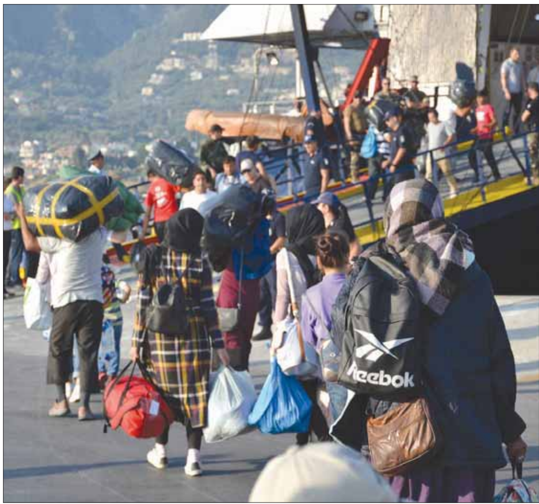
جانب من نقل اللاجئين من مخيم موريا في جزيرة ليسبوس اليونانية أمس