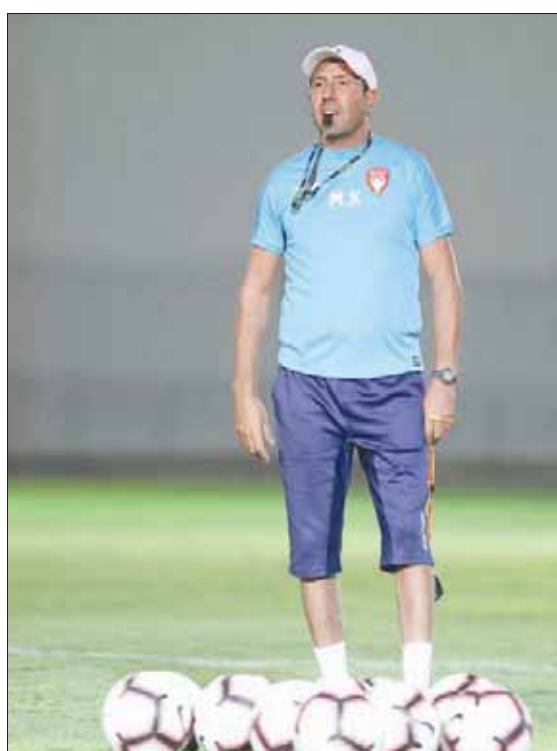
الكرة مهدد بفقدان منصبه في ضمك (المركز الإعلامي بنادي ضمك)

وحول أهمية وجود مدرب وطني مع الجهاز الفني الحالي أو القادم في حال تم تغيير المدرب، قال: المسألة ليست مسألة وجود المدرب الوطني من عدمه، القضية هنا هي أن نجاح أي مدرب في العالم لا يعتمد عليه بشكل فردي وإنما على مساعده وبقية الطاقم، وفي بعض المباريات قد يشاهد مساعد المدرب ما لا يشاهده المدرب الأساسي، نظراً للحالة التي يكون عليها أثناء المباراة من تركيز ويكون بعيداً عن الانفعالات التي تصاحب بعض المباريات، ولذا في النجم الفرنسي زيدان عندما حقق أول بطولة له مع ريال مدريد أعاد الفضل في ذلك الوقت لمساعدته ومدرب اللياقة الذي أعد الفريق بشكل جيد، ومساعدته الذي يعطي ملاحظات مميزة على سير الفريق أثناء المباراة.