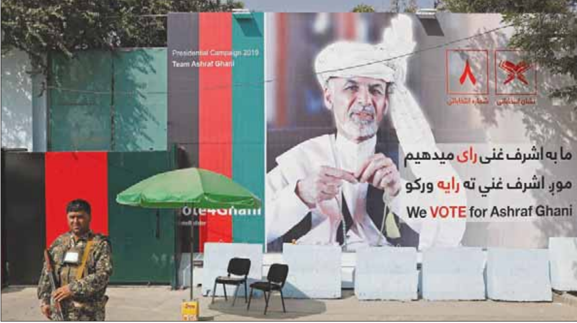
أحد أفراد قوات الأمن أثناء دورية حراسة أمام مؤسسة حكومية عليها ملصق دعائي للمرشح الرئاسي أشرف غني في كابل أمس

على «ويتزر»، إن المقابلة الكاملة ستبث في وقت لاحق، أمس. ومع ذلك، حتى لو غادر قسم كبير من 13 ألف جندي أميركي أفغانستان بعد الجاورة، وقال المسؤولون، أمس، إن هجوم مقاتلي «طالبان» على دونالد ترمب، الأسبوع الماضي، إن واشنطن ستحتفظ بوجود دائم عبر إبقاء 8600 جندي في البداية، حتى بعد الاتفاق مع «طالبان». كان وزير الخارجية الأميركي مايك بومبيو، قد أعلن في وقت سابق أنه يامل في إنجاز اتفاق سلام بحلول الأول من سبتمبر (أيلول)، وقبل الانتخابات المقررة في 28 سبتمبر في أفغانستان. وقال المتحدث باسم «طالبان» سهل شاهين، في الدوحة، السبت، إن «إنجاز الاتفاق بات قريبا»، لكنه لم يحدد العقبان التي لا تزال تحول دون إبرامه. في غضون ذلك،