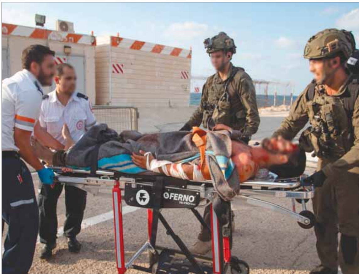
مسعفون إسرائيليون في إخلاء مزيف لجندي مصاب ونقله إلى مستشفى حيفا أول من أمس