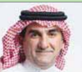
الرياض: «التشرق الأوسط»

عينت شركة «أرامكو» السعودية ياسر بن عثمان الرميان، الأمين العام لمجلس إدارة صندوق الاستثمارات العامة، رئيساً لمجلس إدارتها خلفاً لوزير الطاقة خالد الفالح.