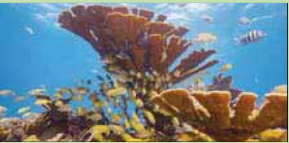
انقراض جماعي للكائنات البحرية

ملاحظاتنا على المحيط الحديث تشير إلى وجود خلل كبير في الأكسجين مما قد يسبب ضغطاً كبيراً على الكائنات التي تتطلب الأكسجين، وقد يكون الخطوات الأولى نحو انقراض عدد من الكائنات البحرية الأخرى. ويضيف: «هناك دروس مهمة يجب تعلمها من الأزمات البيئية في الماضي البعيد، وهذه الدراسة تقدم واحداً من أهم هذه الدروس».