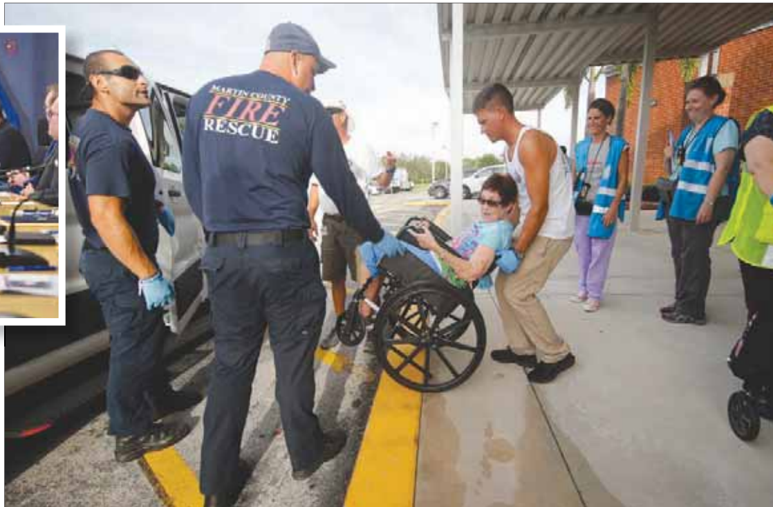
عناصر الإنقاذ يساعدون في إجلاء امرأة من ذوي الاحتياجات في مدينة ستورباتر بفلوريدا تحسباً للإعصار أمس

الصليب الأحمر الأمريكي، يعيش 19 مليون شخص في مناطق يمكن أن يطلها الإعصار، فيما قد يحتاج ما يصل إلى 50 ألف شخص في فلوريدا وجورجيا وكارولينا الجنوبية إلى ملاجئ بشكل طارئ. وأعلن حاكم كارولينا الجنوبية، هنري ماك ماستر، حالة الطوارئ في الولاية، أول مرة منذ عام 1935. وأظهرت صور نشرت على مواقع التواصل الاجتماعي أضراراً بالغة. وأعلن رئيس وكوبا وهايتي، هيوبرت مينيس، «نحن نواجه إعصاراً لم تشهد الباهاماس مثله