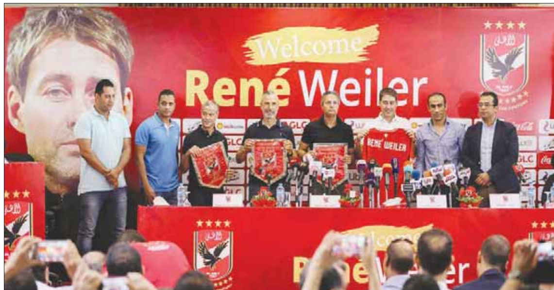
فايلر أمامه مسؤوليات كبيرة بعد تدريبه الأهلي المصري (الشرق الأوسط)

إلى ذلك، وجه التونسي حمدي النقار، الظهير الأيمن للفريق الأول لكرة القدم بنادي الزمالك المصري، التهنة لإدارة والجماهير البيضاء على التأهل للمباراة النهائية لبطولة كأس مصر. وقال النقار أمس الاثنين إن هدفهم في الزمك الفوز ببطولة كأس مصر والحفاظ على اللقب للعام الثاني على التوالي. وأضاف أنه يشعر بالارتياح