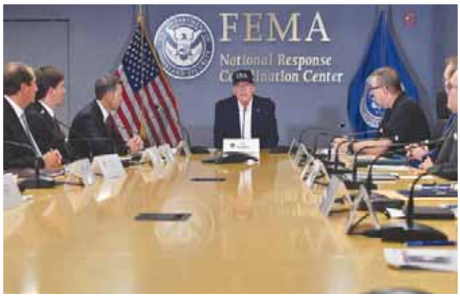
ترمب مجتمعاً مع مسؤولي أجهزة الطوارئ في واشنطن أمس

كذلك في فلوريدا، و12 مقاطعة من ولاية جورجيا. ويسمح هذا الإجراء بتحريك أجهزة الطوارئ بشكل أفضل، والجوء إذا لزم الأمر للمساعدة من السلطات الفيدرالية. وأمرت السلطات أيضاً بإجلاء الزماني في المناطق الساحلية في مقاطعات بالم بيتش ومارتن في فلوريدا، وفي 6 مقاطعات في جورجيا. والجزء الأكبر من فلوريدا هو عبارة عن شبه جزيرة تحدها نفسها كل عام في الصيف. وفي 12 ألف عسكري استعداداً لوصول الإعصار.