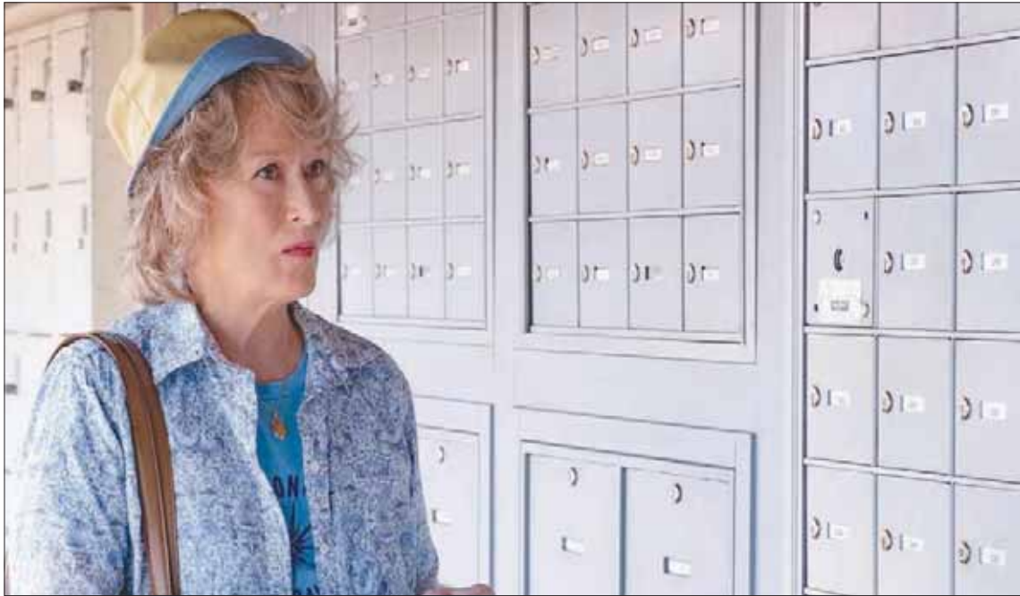
ميريل ستريب في «المغسلة»

تعداده إلى حقيقة أن لا أحد من الشخصيات الأفريقية أو لاتينية الأصول مُقدم لنا كضحية، بل دوماً في شكل أحد المخادعين والصور التي تنهش في لحوم الأحياء كبقية استطاعت. إحدى هذه الشخصيات يؤديها (الأفرو - أميركي) جيفري رايت الذي يلقي القبض عليه، لا بتهمة النصب، بل بتهمة تعدد الزوجات؛ لكن الفيلم جيد على صعيد تنفيذ الحكايات المختلفة، وسلاسة دخول وخروج كل حكاية في سياق كامل، لا عيوب سردية أو تفاصيل فنية غائبة. يستخدم المخرج كاميرته (رد إيبك) بقدرات رائعة. تنساب الكاميرا بلقطات بعيدة وتتحرك بلا تكلف وبسلاسة بارعة. غاية المخرج في النهاية تتشكل من الرغبة في طرق موضوع في غاية الأهمية بنيت بانفجار اقتصادي كبير في المستقبل المنظور (حسب كلام المخرج في حوار يُنشر لاحقاً معه)، ومن عرض هذا الموضوع الجاد بالوسيلة السهلة والممتعة كما لو كان يسرد فيلماً قائماً بأسره على الترفيه.