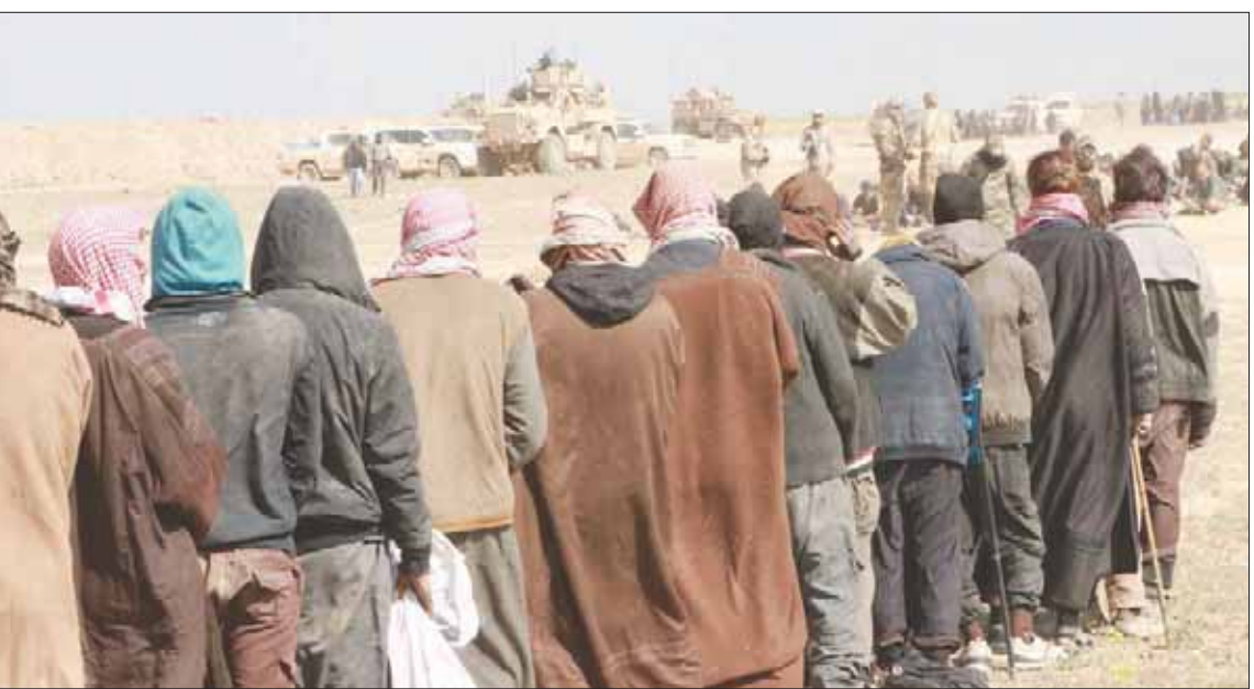
أسرى «دواعش» لدى «قوات سوريا الديمقراطية» شرق الفرات (الشرق الأوسط)

فالشاب لم ينتسب إلى أي جماعة إسلامية أو حزب ديني في بلده تونس، ويعزو السبب إلى: «أيام الرئيس السابق بن علي، هذه الحركات كانت تغازل السلطة، وتعمل تحت إمرتها، لم تمتلك مشروعات وطنية وبرامج