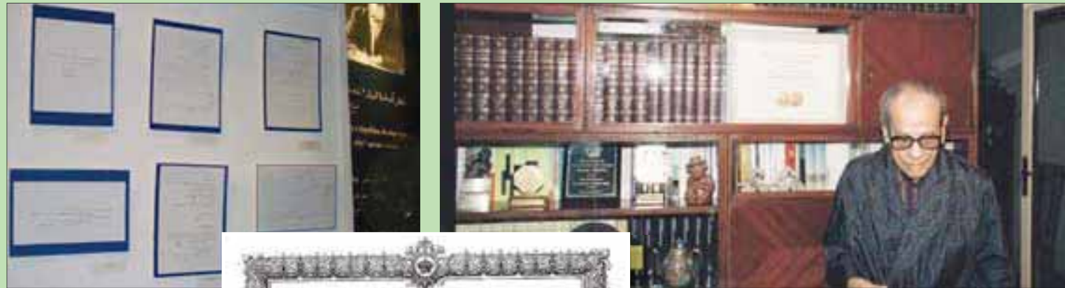
القاهرة، حمدي عابدين

جانب مهم وخفي في حياة الأديب المصري والعالمى نجيب محفوظ، يبرزه متحفه الجديد بمبنى «تكية محمد بك أبو الدهب» بمنطقة القاهرة الفاطمية، بجوار الجامع الأزهر، عبر المعرض المؤقت «نجيب محفوظ بختم النسر» الذي يحتفي بالمستندات والوثائق الرسمية في حياة أديب «نوبل»، الطالب والموظف، ويلخص المعرض مسيرة حياة محفوظ على مدار 37 عاماً، منذ سنة 1934 وحتى 1971.