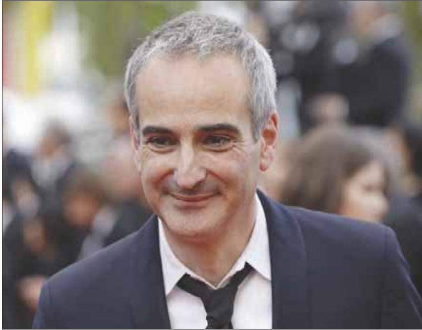
المخرج أوليفيديه أساياس

تعداده إلى حقيقة أن لا أحد من الشخصيات الأفريقية أو لاتينية الأصول مُقدم لنا كضحية، بل دوماً في شكل أحد المخادعين والصور التي تنهش في لحوم الأحياء كبقية استطاعت. إحدى هذه الشخصيات يؤديها (الأفرو - أميركي) جيفري رايت الذي يلقي القبض عليه، لا بتهمة النصب، بل بتهمة تعدد الزوجات؛ لكن الفيلم جيد على صعيد تنفيذ الحكايات المختلفة، وسلاسة دخول وخروج كل حكاية في سياق كامل، لا عيوب سردية أو تفاصيل فنية غائبة. يستخدم المخرج كاميرته (رد إيبك) بقدرات رائعة. تنساب الكاميرا بلقطات بعيدة وتتحرك بلا تكلف وبسلاسة بارعة. غاية المخرج في النهاية تتشكل من الرغبة في طرق موضوع في غاية الأهمية بنيت بانفجار اقتصادي كبير في المستقبل المنظور (حسب كلام المخرج في حوار يُنشر لاحقاً معه)، ومن عرض هذا الموضوع الجاد بالوسيلة السهلة والممتعة كما لو كان يسرد فيلماً قائماً بأسره على الترفيه.