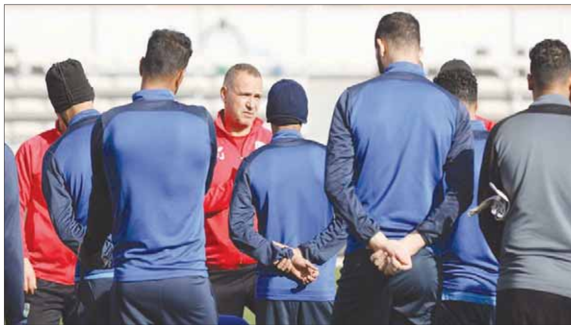
الفتح خسر في أول جولتين بدوري المحترفين (الشرق الأوسط)

لبطولة الدوري، رافضاً الحديث عن بعض الأمور التي يرى بعض أنصار ناديه أنها من أسباب ركلة جزائية ضد النصر، كانت مستحقة بحسب مختصين تكتيكيين أيضاً، مشدداً على