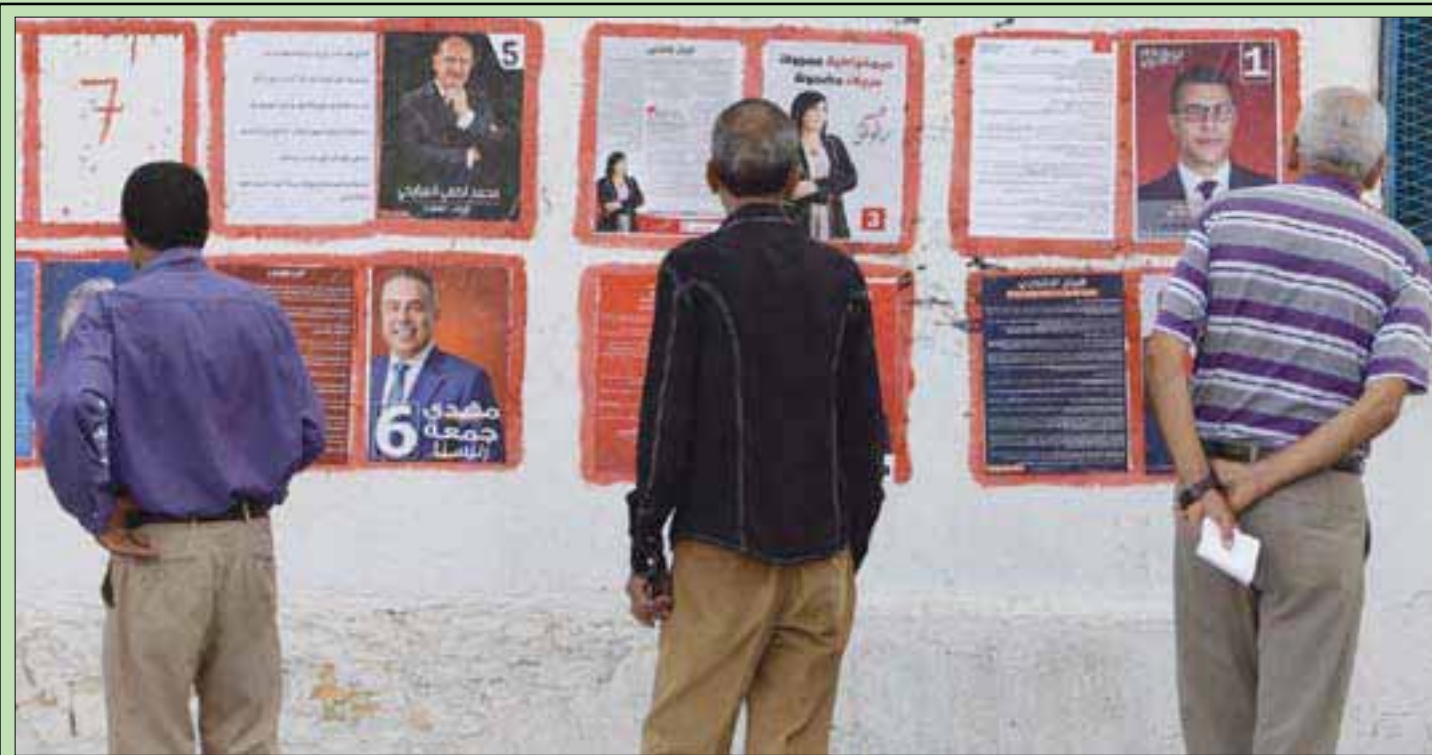
الانتخابات التونسية انطلقت على وقع عملية إرهابية

تونسيون يعابنون ملصقات مرشحين في حملة الانتخابات الرئاسية التي انطلقت أمس، في الوقت الذي شهدت فيه تونس هجوماً إرهابياً نفذته أربعة إرهابيين فجر أمس على حدودها مع الجزائر. (تفاصيل ص9)