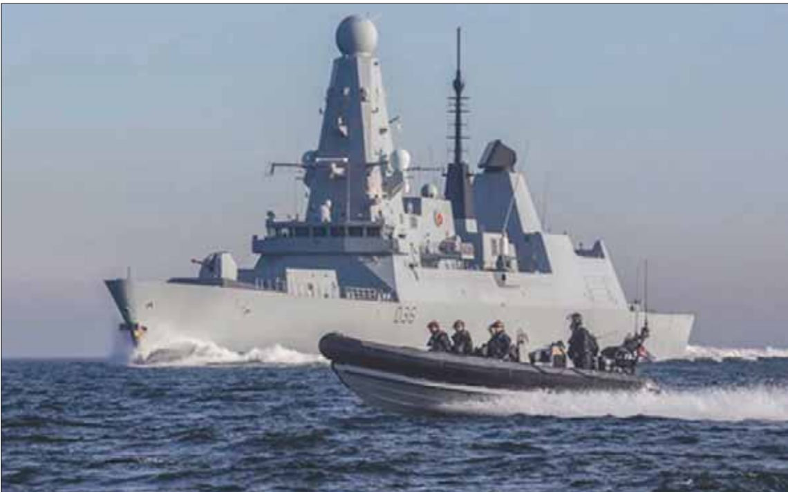
قوات البحرية الملكية خلال مهام في الخليج العربي كما تظهر صورة نشرها موقع الخارجية البريطانية أمس

تدرس لندن إرسال طائرات درون إلى الخليج، في وقت كشفت فيه الحكومة البريطانية، أمس، عن مرافقة البحرية الملكية البريطانية أكثر من 50 سفينة تجارية عبر مضيق هرمز، معبرة في الوقت نفسه عن التزام المملكة المتحدة بالعمل على تخفيف التوترات الحالية.