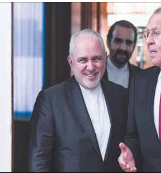
وزير الخارجية الروسي والإيراني في موسكو أمس

وأشار لافروف إلى أنه «في الواقع، نحن وحدنا ورملاًونا الهنود إلى حد ما، وشركاؤنا الصينيون نقوم بذلك، لكن الغرب يرفض رفضاً قاطعاً الاستثمار في تهيئة الظروف لضمان حياة طبيعية بنزحة أنهم لا يستطيعون بدء هذا النوع من العمل حتى يكون هناك وضوح في العملية السياسية».