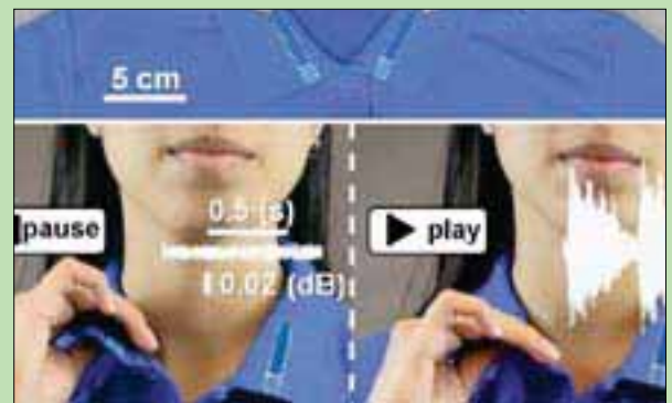
ملابس جامعة بورديو لتشغيل الأجهزة

القاهرة، حازم بدر قد تساعد قريباً الملابس الخاصة بك على تشغيل الأضواء والموسيقى، مع إبقائك متعشياً وجافاً وأماناً من البكتيريا والفيروسات، وذلك بعد أن طور باحثون من جامعة بورديو الأميركية ابتكار نسيج جديد، يتيح لمرتديه التحكم في الأجهزة الإلكترونية من خلال الملابس. ووفق تقرير نشره أمس موقع جامعة بورديو الأميركية، فإن هذا