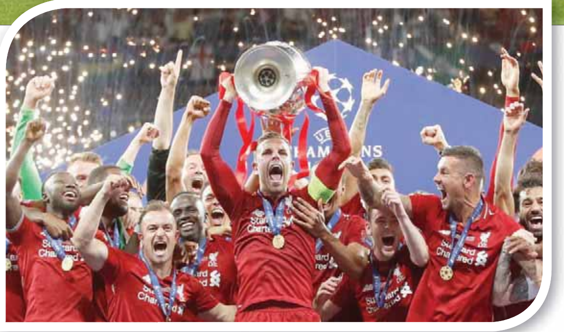
فوز لليفربول بدوري الأبطال عوضه فقدان لقب الدوري الإنجليزي

أن يحذو حذو هؤلاء اللاعبين ويمدد عقده مع لليفربول، فإن خط دفاع الفريق سيكون مؤمناً بصورة جيدة لسنوات قادمة. ومن الأرباح الأخرى للاستثمار الداخلي، والفرز بدوري أبطال أوروبا، وحالة الاستقرار الموجودة في غرقة خلغ ملابس اللاعبين، أنه لم تعد هناك رغبة من جانب أبرز لاعبي الفريق في الانتقال إلى أندية أخرى. ومن المؤكد أن خيارات كلوب ستكون أكثر خلال الموسم الجديد، بعد عودة اليكس أوكسليد تشامبرلين وريسان بروستر وغوميز من الإصابات الطويلة التي لحقت بهم. وقد شارك أوكسليد تشامبرلين بديلاً في مباراتين