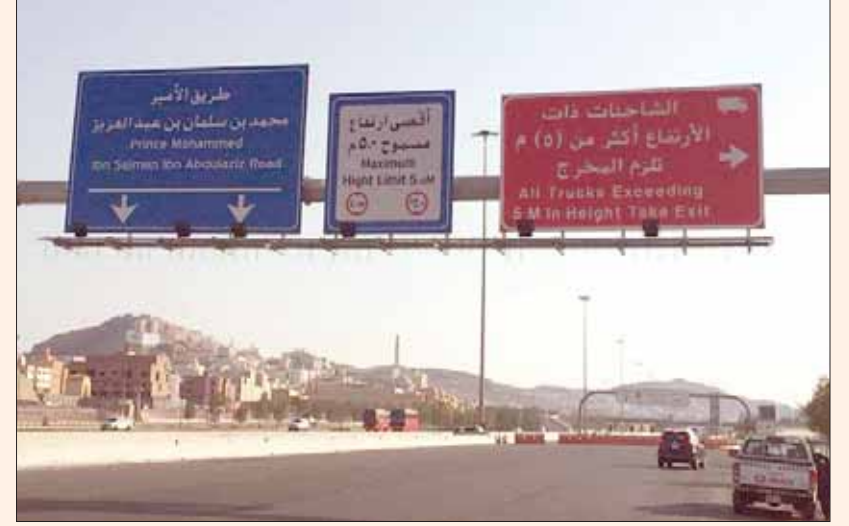
أحد أهم الطرق الحيوية في منطقة مكة المكرمة

منطقة مكة المكرمة، على المقترح الذي تقدمت به الأمانة، وذلك بناء على مرثيات وزارة الشؤون البلدية والقروية، وأن هذه التسمية تقديراً للجهود الكبيرة والمميزة التي يقوم بها الأمير محمد بن سلمان بن عبد العزيز، لتعزيز مسيرة التنمية والتطور بالمملكة في ظل قيادة خادم الحرمين الشريفين الملك سلمان بن عبد العزيز،