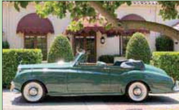
بيع سيارة رولز رويس المبيعة

وقال متحدت باسم دار مزادات جيرنزي في نيويورك لوكالة الأنباء الألمانية إنه تم بيع السيارة لمشتري مجهول. ويشار إلى أنه تم طلاء السيارة باللون المفضل للممثلة، وظهرت في كواليس تصوير فيلم «كيلوبترا» في روما. وقدرت دار جيرنزي بأن السيارة، وهي من طراز سيلفر كلاود، سوف تباع مقابل أربعة أضعاف السعر الذي تم بيعها به. وكان زوج تايلور حين ذاك إيدي فيشر هو من أهداها هذه السيارة عام 1960. وقد احتفظت تايلور بالسيارة لأكثر من 20 عاماً، قبل أن يشتريها كارل كاردييل، الذي