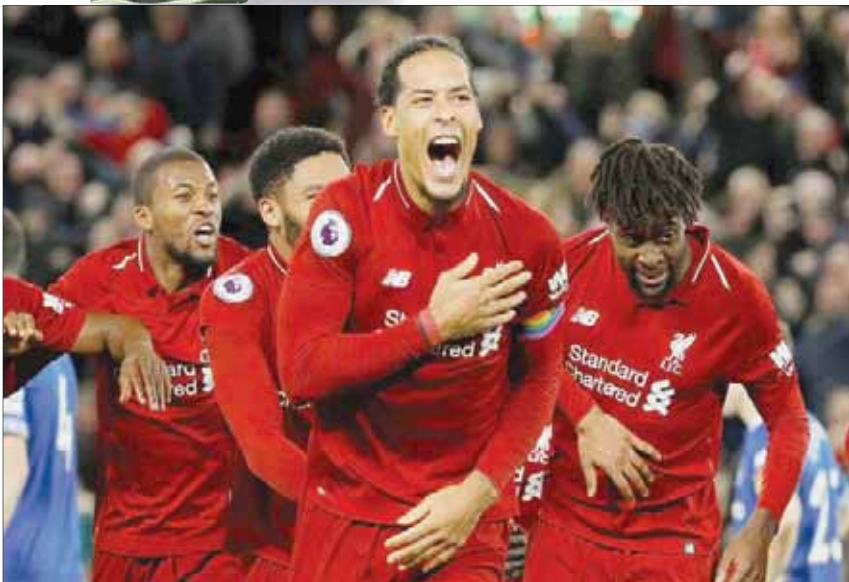
ليفربول وجد حلاً لشكلاته الدفاعية عندما ضم فان دايك

المباراة النهائية لدوري أبطال أوروبا، وحافظ على أدائه الرائع خلال بطولة كأس أمم أميركا الجنوبية (كوبا أميركا) مع منتخب البرازيل الذي فاز باللقب. لقد تمكن حارس المرمى البرازيلي، الذي انضم للليفربول مقابل 65 مليون جنيه إسترليني، من أن يسد نقطة الضعف الواضحة في صفوف الفريق، وهو الأمر نفسه الذي حققه فان دايك بعد انضمامه للريدز مقابل 75 مليون جنيه إسترليني. لقد نجح هذان اللاعبان في تقديم المستوى الذي يبتغى منهما يستحقان هذا المقابل المادي الكبير. إن عدم إبرام لليفربول لصفقات خلال فترة الانتقالات الحالية يثبت