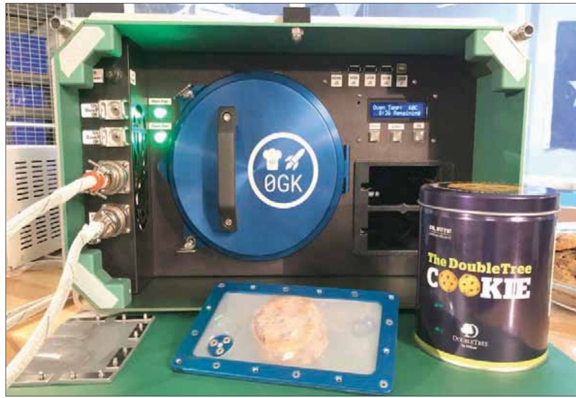
فرن صغير وقطع من عجين الكعك إلى محطة الفضاء الدولية حتى يتمكن الرواد من خبز الكعك في الفضاء لأول مرة

العمل، وفي هذا الصدد، قال أندرو فوستيل، رائد فضاء «ناسا» الذي عاد من زيارته الأخيرة إلى المحطة الفضائية العام الماضي، إن الطعام «يمكن أن يسبح في أي مكان، وفي بعض الأحيان تجد نفسك تستخدم ملعقتك أو فمك لمطابقة الطعام والتأكد من أنك قد وضعت كل شيء في فمك، قبل أن يطير ليلصق بالسجاد أو بوجه شخص ما».