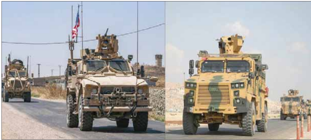
صورتان منفصلتان لعربات أميركية وتركية شمال سوريا