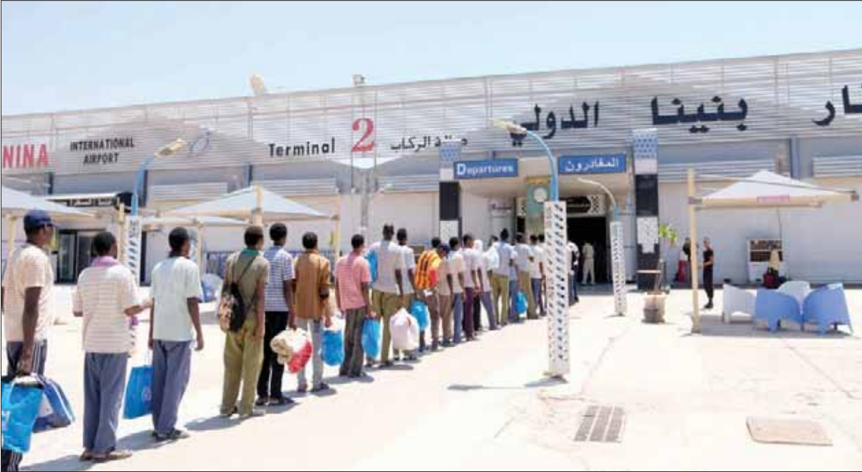
مهاجرون غير شرعيين من السودان ينتظرون ترحيلهم في بلادهم عند مدخل مطار بنينا في بنغازي أمس

سرت، أن قوات الجيش ستأخذ بنار أبيه، «وكل شهيد سقط أمام الميليشيات الإرهابية الإجرامية، التابعة لمجلس مصراتة العسكري، والتي ترتكب الجرائم ضد أهالي ليبيا يوماً».