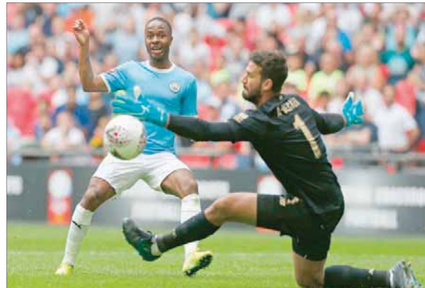
اليسون حامي عرين لليفربول