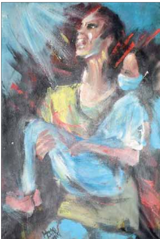
عمل يجسد مشهد من الانفجار للفنان حسني أبو بكر