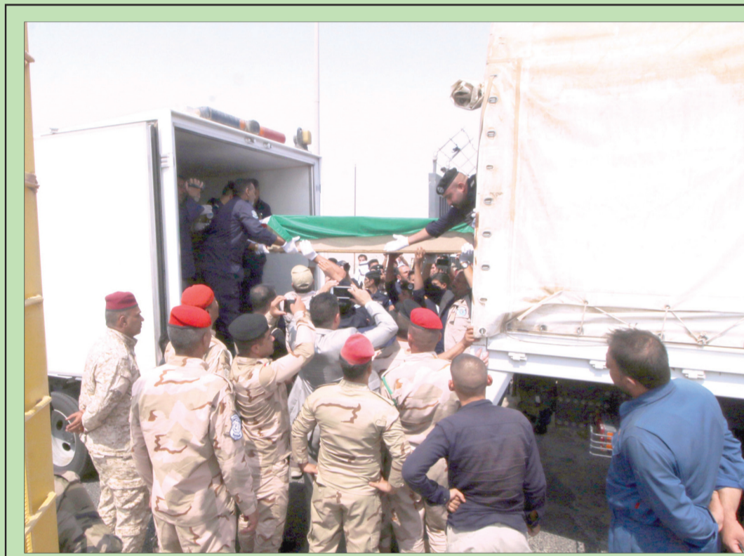
تسلمت الكويت من العراق أسس رفات 48 من مفقوديتها خلال حرب الخليج الأولى. وحصل التسليم في البصرة مع الإعلان عن تحديد هويات أصحاب الرفات (رويترز) (تفاصيل ص9)

عدن: علي ربيع وسلامة أراضي». ودعا سفراء الصين والولايات المتحدة وفرنسا وروسيا والمملكة المتحدة لدى اليمن، إلى «إنهاء جميع أعمال العنف فوراً، والانخراط في حوار بناء لحل الخلافات سلمياً». وكان السفير السعودي لدى اليمن محمد ال جابر أكد في تغريدة على «تويتر» أن عدن ستبقى آمنة ومستقرة بحكمة العقلاء وبدعم التحالف. في غضون ذلك، عزب التحالف الوطني لأحزاب والقوى السياسية اليمنية أساس المشكلة الأمنية في المناطق المحررة إلى «وجود تشكيلات مسلحة خارج سيطرة وزارتي الدفاع والداخلية»، محذراً من أن استمرار الظاهرة، «يمثل تهديداً خطيراً لوجود عدد من المكونات الجنوبية إلى التبرؤ من صراع الدم بين رفاق السلاح الجنوبيين». ورفض الاتحاد الأوروبي، في بيان، تصاعد العنف، وأعرب عن تأكيده «على الالتزام بوحدة وسيادة واستقلال اليمن