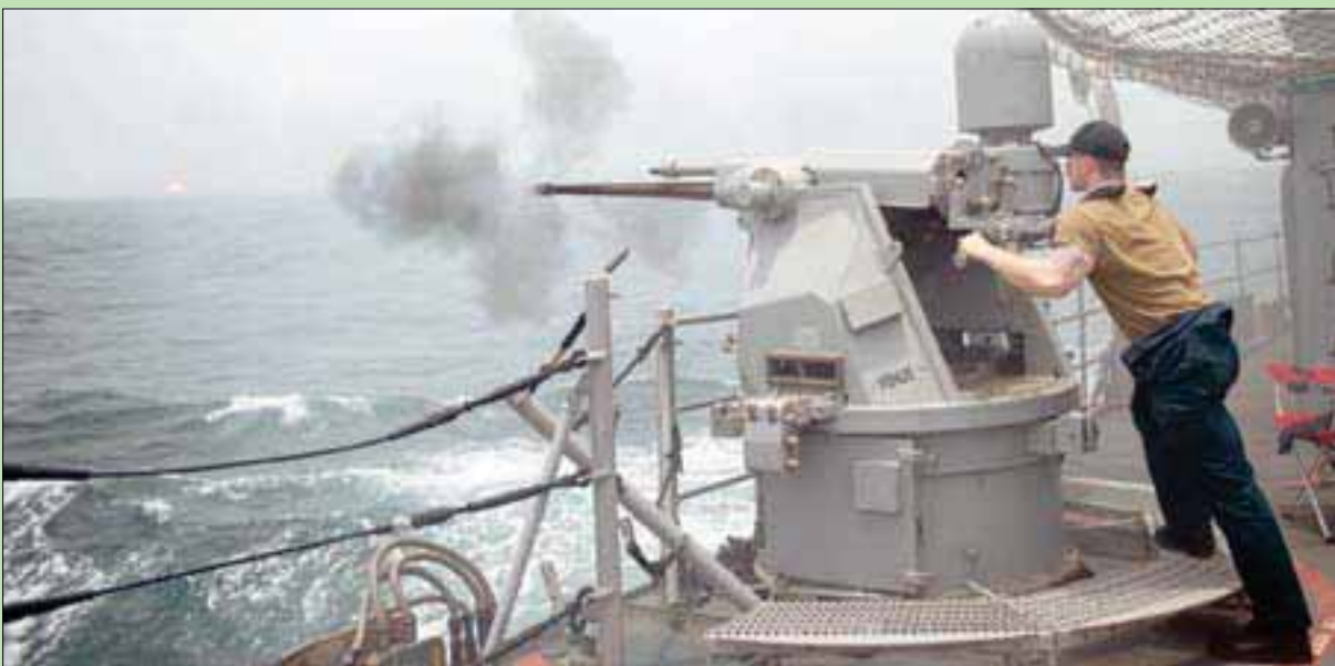
عنصر من البحرية الأميركية خلال مناورة لمواجهة الحالات الطارئة بالبحيرة الحية على متن سفينة «يو إس إس ليتي غولف» التابعة لحاملة الطائرات أبراهام لينكولن في موقع بالمحيط الهندي