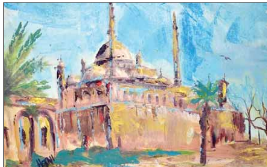
من أعمال معرض «الفن يحارب الإرهاب»

عمل يجسد مشهد من الانفجار للفنان حسني أبو بكر