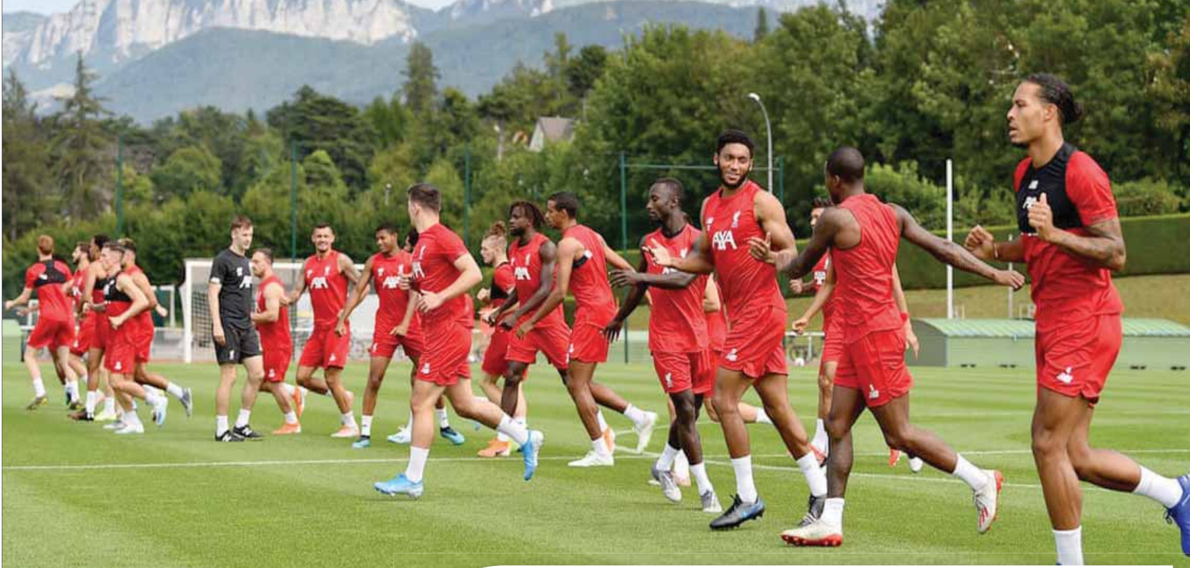
لاعبو ليفربول يتدربون في فرنسا استعداداً للموسم الجديد

وتحب الإشارة أيضاً إلى أن هناك وحدة وتلاحماً بين عناصر لليفربول، سواء داخل أو خارج الملعب. ولا يوجد هناك حاجة لأي تغيير تكتيكي أو خططي للشكل الذي يلعب به لليفربول منذ 12 شهراً، نظراً لنجاح خط