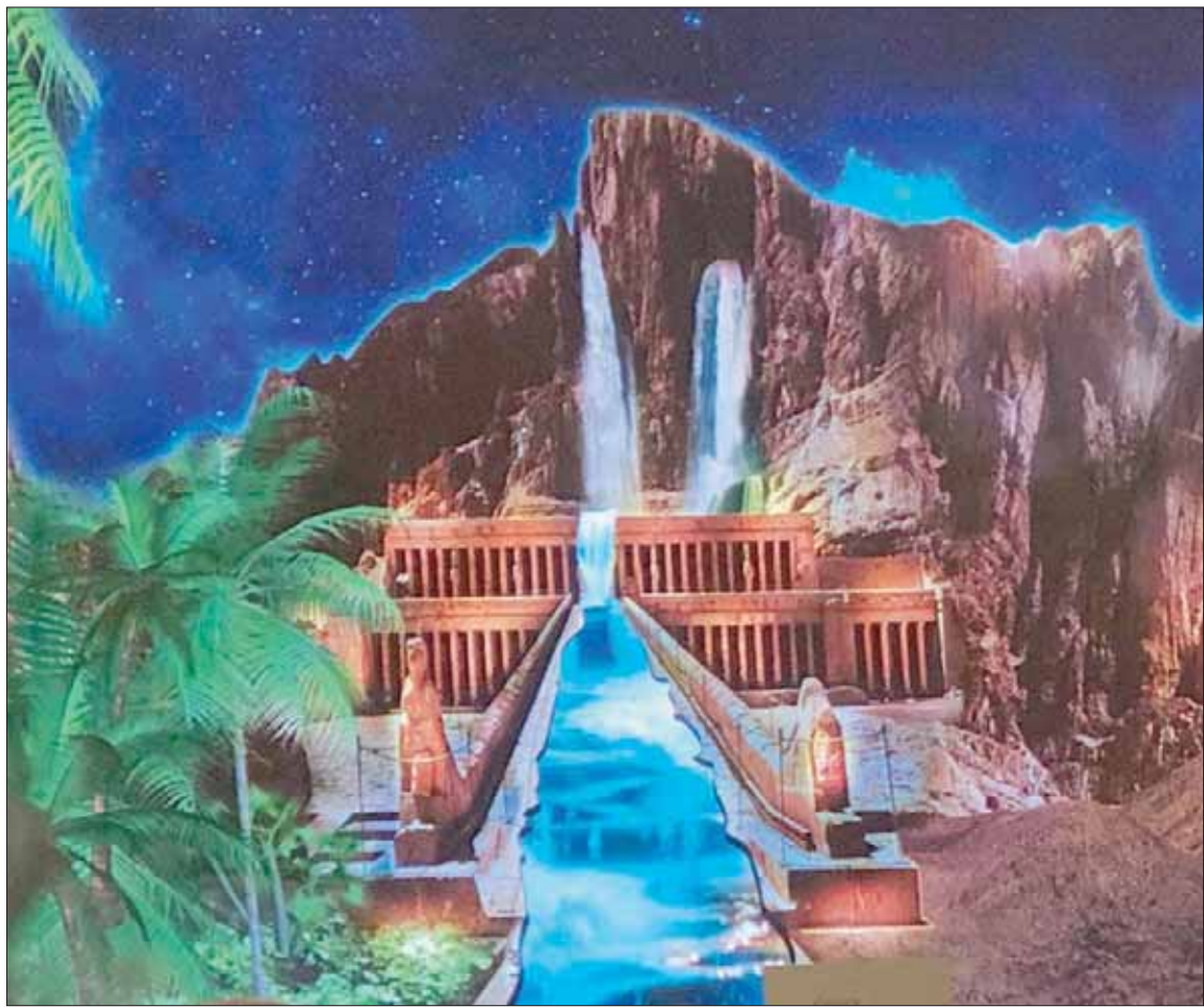
مشهد تخيلي لكيفية استخدام الإضاءة المجهزة في حفل «أوبرا عايدة» أمام معبد حتشبسوت