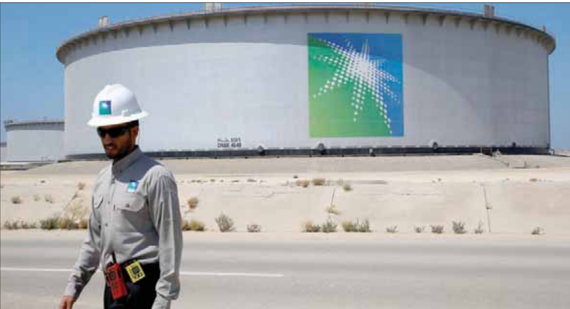
الطلبات التي تقدمها شركات التكسير والعملاء لشراء الخام السعودي مرتفعة في سبتمبر (رويترز)

لن تتساهل مع التراجع المستمر لأسعار النفط، وتدرس كل الخيارات المتاحة، دون أن يكشف عن الإجراءات التي تجري مناقشتها. في غضون ذلك قفزت أسعار خام برنت بأكثر من دولار للبرميل أمس، نتيجة التحركات السعودية، معوضة نصف خسائر بلغت نحو 5% في الجلسة السابقة. وبحلول الساعة 16:30 بتوقيت غرينتش، صعد خام برنت إلى 57,51 دولار للبرميل بزيادة 1,28 دولار أو 2,27% بالمقارنة مع الإغلاق السابق. وارتفع خام غرب تكساس الوسيط الأمريكي 1,61 دولار أو 3,25% إلى 52,77 دولار للبرميل. وتراجعت العقود الآجلة للخامين إلى أدنى مستوى منذ يناير (كانون الثاني)، الأربعاء، بعد ارتفاع مفاجئ في مخزونات الخام الأميركية إضافة إلى مخاوف من زيادة تأثر نمو الطلب سلباً في العام الحالي بفعل الحرب التجارية بين الصين والولايات المتحدة.