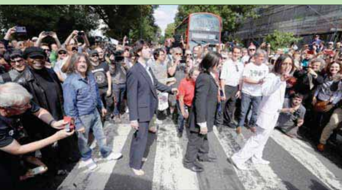
تجمع من الأشخاص يقلدون البيتلز في عبور المشاة

يحمل سيارة، وأخيراً هاريسون في ملابس زرقاء، وتظهر سيارة فولكسفاغن من طراز بيتل متوقفة في خلفية الصورة. وعادت السيارة البيتل إلى مكانها وتحركت السيارات ببطء بطول الشارع المزدحم، في حين سار عشرات المعجبين على نقطة عبور المشاة بخطوطها البيضاء لالتقاط صور للذكرى. وفاز اليوم (أبي رود) بلقب أفضل اليوم للفرقة في تصويت شارك فيه قراء مجلة «رولينغ ستون» في عام 2009. وكان الألبوم آخر ما سجله أعضاء الفرقة الأربعة معاً، ويشتمل على أغنان من تأليف كل منهم. وانفصل أعضاء فرقة موسيقى الروك التي حققت أفضل المبيعات بعد أقل من عام من صدور اليوم (أبي رود)، لينهوا ثورة في عالم الموسيقى استمرت عقداً من الزمن وأحدثت تحولاً في فترة الستينات.