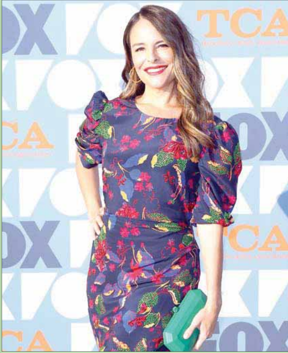
المثلة الأميركية يارا مارتينيز تحضر حفل «فوكس» للنجوم في استوديوهات «فوكس» في لوس أنجلوس

يوجد في أدبيات الجماعات الإرهابية المسلحة فكرة تستخدم بمثل هذه الحالات هي «القتل» يعني لو لم تقدر على ضرب هدفك الأصلي إلا من خلال إرباء جعلهم العدو ترساً لا بأس؛ كما توجد مقولة تستخدم دوماً لتسويغ مثل هذه الحالات وهي: «يبعثون على نباتهم»؛ المهم التهوين من الجريمة... والاستمرار فيها.