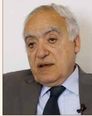
القاهرة، جمال جوهر

لم تلبث أن تهدأ حملة الانتقادات التي طالت المبعوث الأممي لدى ليبيا غسان سلامة، حتى عادت لتشتعل من جديد بعد دعوة المفتي المعزول الصادق الغرياني الشعب الليبي للخروج في مظاهرات عارمة عليه، والمطالبة بطرده من البلاد.