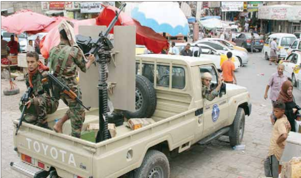
عناصر أمنية من الحزام الأمني متمركزة في سوق بعن أس

من يريد زعزعة أمن واستقرار البلاد، والتحقيق الجاد في مقتل «أبو اليمامة» ورفاقه. إلى ذلك، دعا مكثراً «الحراك الجنوبي» المشارك في الحكومة الشرعية في بيان إلى التهذبة وتحكيم صوت العقل، وقال إن «الصراع الجنوبي - الجنوبي لا يخدم إلا العدو الرئيسي (إيران وأدواتها الحوثية)، كما يخدم أجدات خارجية تستهدف الوطن والمواطن وتضعف تحالف دعم الشرعية والقضية الجنوبية».