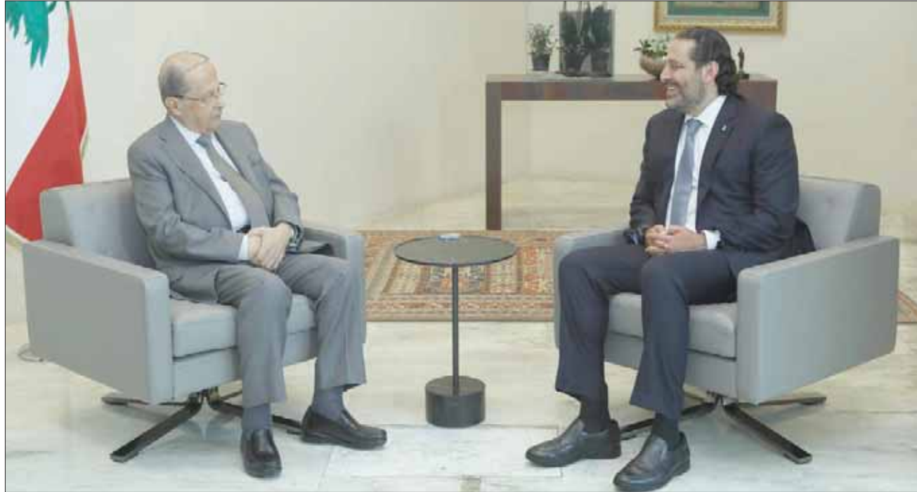
من لقاء الرئيسين عون والحريري أمس (الدائري ونهرا)

ويوافق أبو الحسن على أن «أي صراع سياسي محكوم بالتسوية في نهاية الأمر، وكل تاريخ لبنان يدل على ذلك. لكن ضمانة جنبلاط ليست بالتسويات وإنما بما يمثله ككيان متحدر في تاريخ لبنان. وقد بينت هذه القضية أنه محاط بالأوفياء ولا أحد يستطيع أن يستفرد به أو يبلغيه». أما أبي السمع، فيعتبر أن «العودة إلى 14 آذار أصبحت ملحّة في هذه المرحلة لأن مسار الأمور غير سليم، بالتالي هناك ضرورة لتصويبه. فالوضع لا يسمح بتفريط تعطيل العمل الحكومي على خلفية أخذ قضية قبرشومون إلى طابع المحاكمة السياسية».