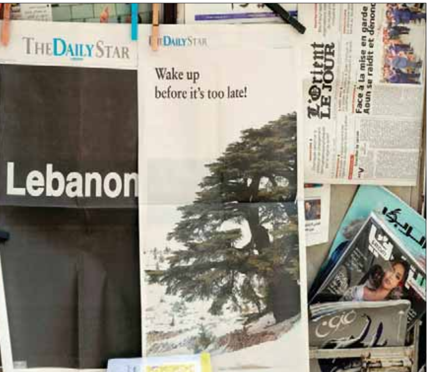
الصفحتان الأولى والأخيرة من صحيفة «دايلي ستار» كما صدرت أمس

ويعتقد أن الاجتماع قد يفتح باباً جديداً للتفاوض بين الطرفين، خاصة في ظل استمرار الأزمة السياسية.