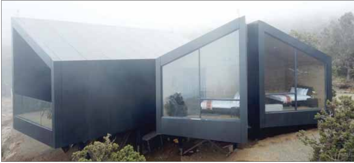
تصميم عصري مستوحى من صقر الشاهين