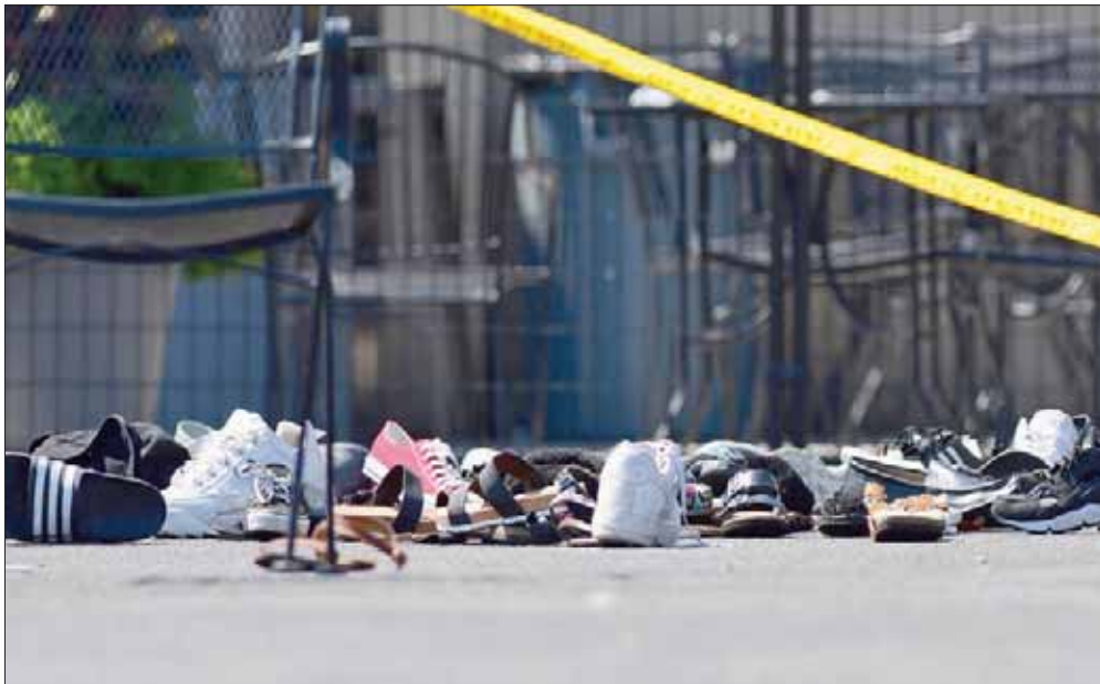
أحدية لمقاء في موقع إطلاق النار في دايتون بولاية أوهايو أمس