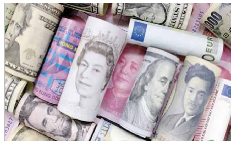
الدولار الأميركي قد سجل ارتفاعاً هائلاً رغم أن خفض أسعار الفائدة يعد من العوامل التي تعكس سلباً على العملات بصفة رئيسية

هذا وقد بدأ المسار الهبوطي الحاد لنشر رئيس ترمب تخفيضات الوزارات البريطاني الجديد بوريس