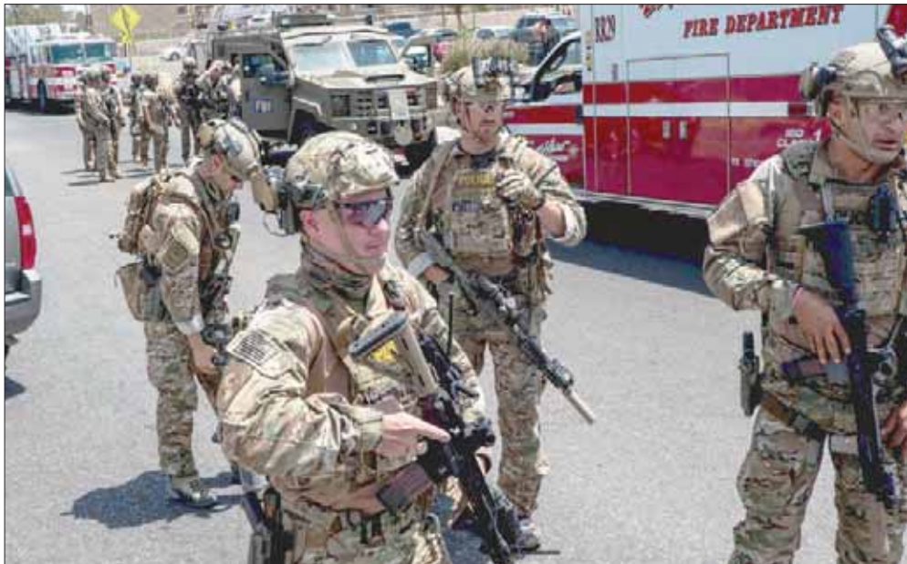
انتشار قوات الأمن في موقع جريمة إل باسو أول من أمس