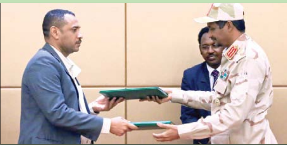
نائب رئيس المجلس العسكري محمد حمدان دقلو الملقب (حميدتي) والقيادي في «قوى الحرية والتغيير» أحمد ربيع يتبادلان نسختين من وثيقة الإعلان الدستوري بعد توقيعهما في الخرطوم أمس

عليه، سيعلن في 20 من الشهر ذاته اسم رئيس الوزراء الجديد الذي ستضطلع حكومته بجمع السلطات التنفيذية في نظام مدني برلماني، يتبعه يوم 28 إعلان أسماء أعضاء مجلس الوزراء الذين سيختارهم رئيس الحكومة بالتشاور مع «قوى الحرية والتغيير» التي قادت الاحتجاجات الشعبية على مدى 8 أشهر أدت إلى إسقاط نظام عمر البشير في 11 أبريل (نيسان) بعد 30 عاما من الحكم. ورحبت أمس كل من السعودية ومصر والإمارات والبحرين، إضافة إلى منظمات خليجية وعربية ودولية، بالاتفاق الذي تم التوصل إليه في السودان، معتبرة أنه يمثل «نقلة نوعية» نحو الأمن والاستقرار بعد أزمة سياسية طال أمدها. الخروطوم: أحمد يونس وَقَّع المجلس العسكري الانتقالي في السودان مع قادة الحراك الشعبي بالأحرف الأولى الذي أعلن الدستوري» الذي يشكل، مع الإعلان السياسي المبرم قبل أسبوعين، الاتفاق الشامل للانتقال السلطة إلى حكم مدني. ومن المنتظر أن يوقع الطرفان بشكل نهائي على الاتفاق يوم 17 من الشهر الحالي، في مراسم بالعاصمة الخرطوم يحضرها زعماء أجناب وممثلون لهيئات دولية. وفي اليوم التالي للتوقيع الرسمي، سيحل «المجلس العسكري» نفسه ليقيم محله مجلس سيادي مشترك من 6 مدنيين و5 عسكريين يتولى شؤون السيادة في البلاد بسلطات محدودة. ووفق الجدول الزمني المتفق