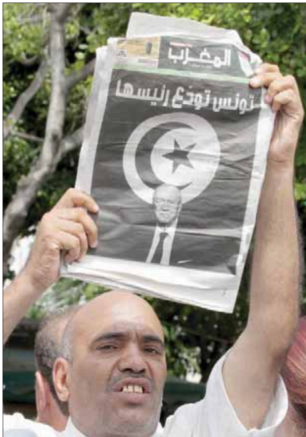
وفاة الرئيس السبسي كان وقعها كبيراً على وسائل الإعلام التونسية التي استغللت الحدث لتؤكد مدى ولانها لجدائى الجمهورية (إ.ب.)

يذكر أن برنامجاً أوروبياً مخصصاً لدعم المؤسسات المستقلة في تونس، أطلق خلال الشهر الماضي ويمتد على ثلاث سنوات من 2019 إلى 2021 يتمويل من كل من الاتحاد الأوروبي بنسبة 90 في المائة ومن قبل مجلس أوروبا بنسبة 10 في المائة، وهو يهدف إلى دعم قدرات الهيئات التونسية المستقلة ومساعدتها على أداء المهام الموكلة إليها في مجال التعديل والرقابة على المحتويات الإعلامية. ويسعى الجانب الأوروبي إلى وضع قانون للتصدي لمسألة التلاعب بالمعلومة بهدف دعم وتقوية الإطار القانوني، الذي اعتبر غير مؤهل لمواجهة الأخبار الزائفة والمعلومات الخاطئة في المنظومة الرقمية الحالية. وفي السياق ذاته، قال محمود