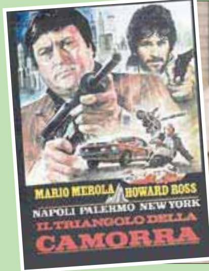
عصابات «كامورا» في مدينة نابولي الإيطالية

وفي شهر مايو (أيار) الماضي، نشر الوزير سالفيني مقطع فيديو على موقع التواصل الاجتماعي «فيسبوك»، هدد فيه سافيانو بسحب الحراسة والحماية التي توفرها الشرطة له. وراى سافيانو في ذلك تهديداً من زعيم «الرابطة» مفاده: «إذا ما وصلت الهجوم عليّ، ستارك وحيداً». وكان رد فعل سافيانو: «لن ترهني».