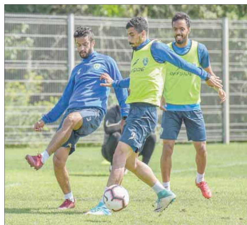
من تدريبات الفتح في معسكر سلوفينيا