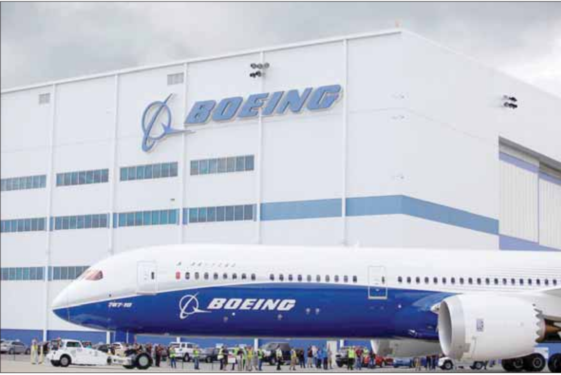
تضررت سمعة الشركة منذ تجميد طائراتها من طراز «737 ماكس» قبل أربعة أشهر بعد كارثتين جويتين أسفرتا عن مقتل 346 شخصاً

تخلفها وكالة الفضاء «ناسا».. و«بوينغ» حاضرة رمزياً أيضاً في السلطة الأميركية لكونها مصنع الطائرة الرئاسية «إير فورس وان»، ويشكل شراء طائرات «بوينغ» أيضاً جزءاً من المفاوضات التجارية مع الصين، وفق مصدر قريب من الملف، وفي نهاية الشهر الماضي، أعلنت شركة «بوينغ» عن خسارة بقيمة 2,9 مليار دولار في الربع الثاني من العام نتيجة أزمة طائرات «737 ماكس»، بما يشكل الخسارة الأكبر في فصل واحد للصناعات الجوية، وفي وقت لا يزال منع «737 ماكس» من التحليق منذ مارس (آذار) الماضي يثقل على الشركة، مكلفاً أرباحها نحو 8 مليارات دولار في بعض التقديرات، فإن الكشف عن حجم الخسارة للربع الثاني من العام يأتي بعدما أعلنت الشركة في منتصف يوليو 4,9 مليارات دولار بعد خصم الضرائب لدفع تعويضات للزبائن الذين تضرروا في الأزمة، وتراجعت العائدات بنسبة 35,1 في المائة إلى 15,8 مليار دولار، ما يعكس أيضاً تأثير وقف عمليات تسليم طائرات «737 ماكس»، التي كانت الأكثر مبيعاً. وتعمل «بوينغ» على تطوير برمجيات لمعالجة الخلل الذي يشهده بتسببه بالحدائق. وأرجحت الشركة، بصورة متكررة، التواريخ التي كانت على قدمها لعودة هذه الطائرات إلى الخدمة، خصوصاً بعدما أعلنت هيئة الطيران الفيدرالية الأميركية في يونيو (حزيران) الماضي أنها اكتشفت خللاً يتعلق بمعالج دقيق على الطائرة خلال اختبارات على أجهزة المحاكاة.