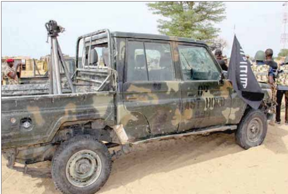
سيارة تابعة على ما يبدو إلى تنظيم «داعش» في غرب إفريقيا، بمدينة باغا النيجيرية الجمعة

أكد تقرير جديد أعده خبراء الأمم المتحدة، أن خسارة «داعش» لمعقل الأخير، في بلدة الباغوز السورية، شكل منعطفاً في المعركة الدولية ضد الجماعات الإرهابية، لكنهم حذروا من أن التنظيم «واصل تطوره نحو شبكة سرية، تعمل في كل من سوريا والعراق ودول الجوار، مؤكداً أنه لا يزال قادراً على «تسيير هجمات دولية». وأشار إلى وجود المئات من عناصر التنظيم في المناطق الواقعة تحت سيطرة الحكومة السورية.