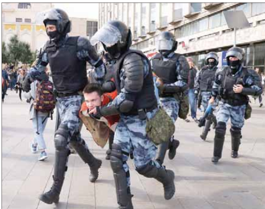
عناصر شرطة يعتقلون متظاهراً في موسكو أول من أمس

حتى الآن في منأى عن السجن. واعتبرت ألمانيا أن روسيا خرقت التزاماتها الدولية بإجراء انتخابات حرة ونزيهة، بعد حملة الاعتقالات، وأعلنت أن مع سلمية الناشطة البارزة ليوبوف سوبول، بعدما حذرت السلطات من أن المظاهرات غير قانونية. وألقت الشرطة القبض على سوبول، وهي حليفة للسياسي المعارض اليساري أليكسي نافالني، من سيارة أجرة قبل دقائق من بدء ما وصفه نشطاء معارضون للكرملين بأنه «مسيرة سلمية للاحتجاج على استبعاد مرشحيه من انتخابات» تجري الشهر المقبل، كما ذكرت وكالة «رويترز».