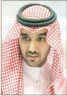
الأمير عبد العزيز الفيصل