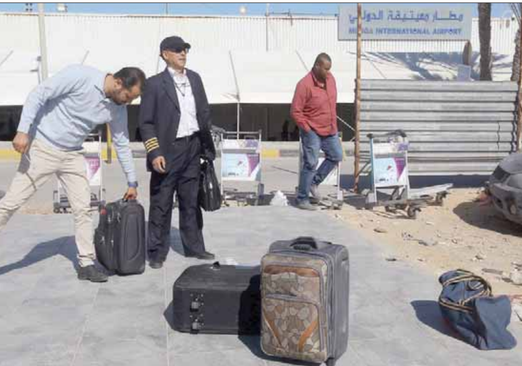
مطار معيتيقة في العاصمة الليبية طرابلس (أ.ف.ب)

ومع دخول عملية تحرير طرابلس، التي أطلقها الجيش خليفة حفتر القائد العام لـ«الجيش الوطني الليبي»، في الرابع من شهر أبريل (نيسان) 2011. الماضي، أمس، شهرها الخامس على التوالي، أكدت شعبة الإعلام الحربي التابعة للجيش قيام مقاتلات سلاح الجو باستهداف رتل عند خروجه من مدينة مصراتة بغرب البلاد، تحديداً بمنطقة بوقرين، لافتة إلى أن الرتل ضم عدداً من جماعات الحشد الميليشاوي، وأفراداً من «مجالس شوري» ببنغازي، ودرنة، وأجدايا، المتحالفة مع تنظيم «داعش». وعلى الرغم من الأوضاع المأساوية في البلاد، أعلن علي العيساوي، وزير الاقتصاد بحكومة السراج، أمس، عن مشروع ضخ لإنشاء شبكة لتزويد 10 مليارات ليتر من المياه، و«إيجاد العاملين بغرفة التحكم، كما حثت المدن التي ترفض طرح الأعمال بالدخول في عملية الطرح المبرمج من قبل الشركة الكهروكهربائية وإعادة التيار الكهربائي لكافة ربوع البلاد».