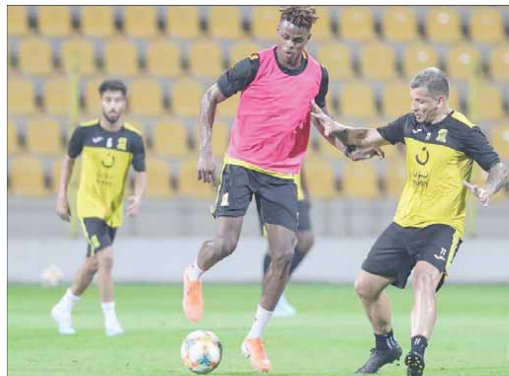
من استعدادات الاتحاد للمواجهة الآسيوية (الشرق الأوسط)

جدة: إبراهيم القرشي الرياض: عبد الله الملاحي