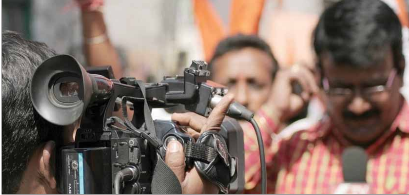
من المتوقع أن يصل حجم السوق الإعلامية الهندية إلى 52.68 مليار دولار في عام 2022