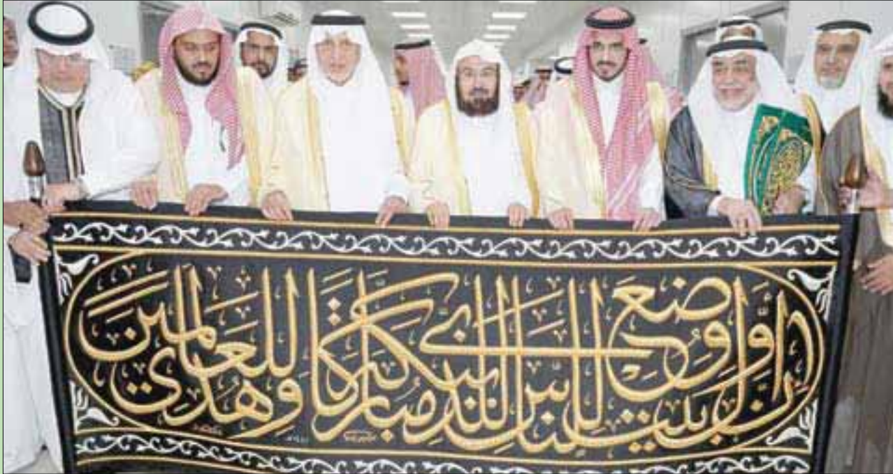
أمير مكة المكرمة خلال تسليم كسوة الكعبة المشرفة الجديدة

كما تم تقديم عدد من العروض والغرضيات العسكرية التي اشتملت على استعراض لأبرز الأليات الحديثة المستخدمة ضمن مهام هذا العام، وقدم خلال فترة الاستعراض عدد من عروض الطيران، ومن ثم تم عرض الأليات وطيران الأمن ونوعيات الطائرات التي سيتم العمل بها في حج هذا العام لمراقبة