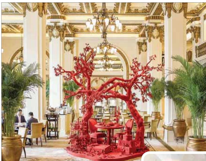
الفنان الأسترالي تيموثي بول مايرز يقوم بلف أدوات الحياة اليومية مثل الأقداح والصحون والكراسي ذات اللون الأحمر ويجعل منها منحوتات خاصة يطلق عليها مسمى «اليزارين»

بكل الفنان باي شيء. ويعتقدون في الفنادق أن مواصلة تغيير المعارض هي من عوامل جذب الضيوف للزيارات المتكررة. وأصبح تثبيت الجداريات من الوسائل الشائعة على نطاق واسع لإضفاء روح جديدة على تصاميم الغرف.