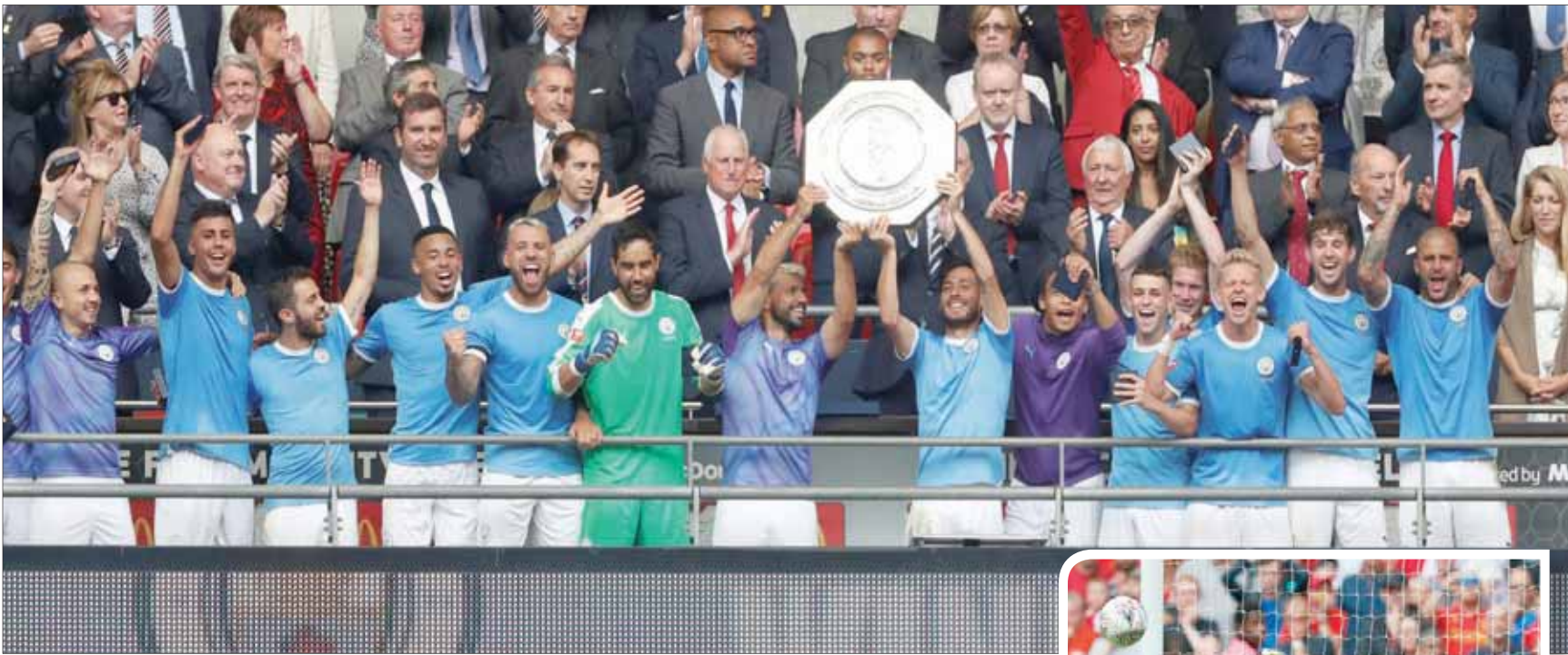
لاعبو مانشستر سيتي على منصة التتويج يحتفلون بالدرع الإنجليزية الخيرية

وتقدم ستريكينج، لاعب ليفربول السابق، بهدف سيتي في الدقيقة 12 وسط سيطرة تامة على الشوط الأول، وجاء الهدف بعدما لمس ديفيد سيلفا كرة عرضية وغير اتجاهها إلى ستريكينج الذي سدده بقدمه من مدى قريب، وأخفق الحارس اليسون بيكر في إبعاده، رغم أنه كان قريباً من الإمساك بالكرة.