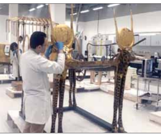
جانب من أعمال الترميم الأثري لتابوت توت عنخ آمون الفرعون الذهبي بمركز الترميم في المتحف الكبير

وعدها 5398 قطعة». ويثير نقل التابوت تساؤلات حول مومياء الفرعون الذهبي، المعروضة حالياً في مقبرته بوادى الملوك بالأقصر، جنوب مصر، حيث يتبادل عدد من الأثريين بنقلها إلى المتحف الكبير، لتكتمل المجموعة الكاملة لتوت عنخ آمون، خصوصاً في ظل الحالة السيئة للمومياء في المقبرة، وتعرضها لأخطار نتيجة الهواء الملوّث من أنفاس السياح. وقال زيدان إن «المومياء موضوعة في فاترينة زجاجية، وقد تعرضت للتلف عند اكتشافها، عندما حاول كارتر إزالة القناع عنها»، مشيراً إلى أن «المومياء تحتاج إلى قرار جريء بنقلها لتكون في جو مناسب يحافظ عليها». وأوضح وزيرى أن «المومياء تم إخراجها من التابوت في 5 يناير (كانون الثاني) عام 2005، ووضع في فاترينة زجاجية لتوفير بيئة ملائمة لها، لكن هل هذه أجواء مناسبة لمومياء مقارنته بالآجواء الموجودة في المتاحف؟»، مشيراً إلى أنه «لا