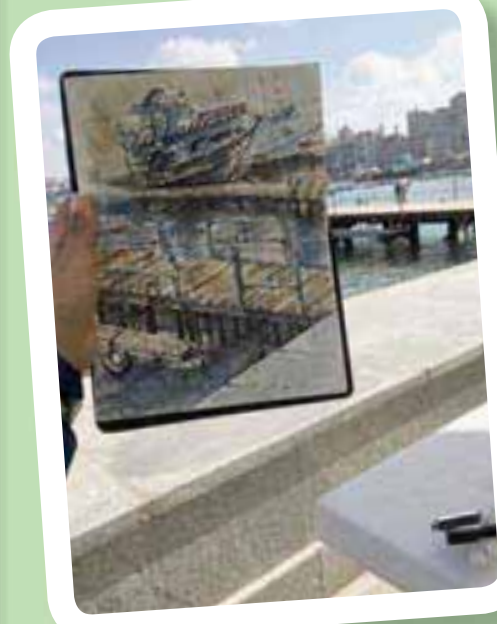
تعاون مكتبة الإسكندرية مع مؤسسة راقودة للفن والتراث

فنية متنوعة. وتوفر المؤسسة قاعة اطلاع، وتضم مكتبة علمية رقمية وورقية متخصصة في العلوم والفنون والآثار والآداب. كما تفتح المؤسسة التي تم إنشاؤها على يد مجموعة من شباب مصر أبوابها لكل من يمتلك المهوية والإبداع، ويريد نشرها إلى المجتمع السكندري، من أجل تطوير التعليم غير المباشر للحفاظ على التراث المصري، ونشر الوعي الثقافي، وتوسيع دائرة المشاركة الإيجابية بين جميع أفراد المجتمع.