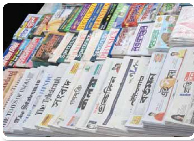
مع أن حصة الصحافة الورقية تراجعت فإنها ما تزال تحصل على دولار واحد من كل 3 دولارات إعلانية في الهند