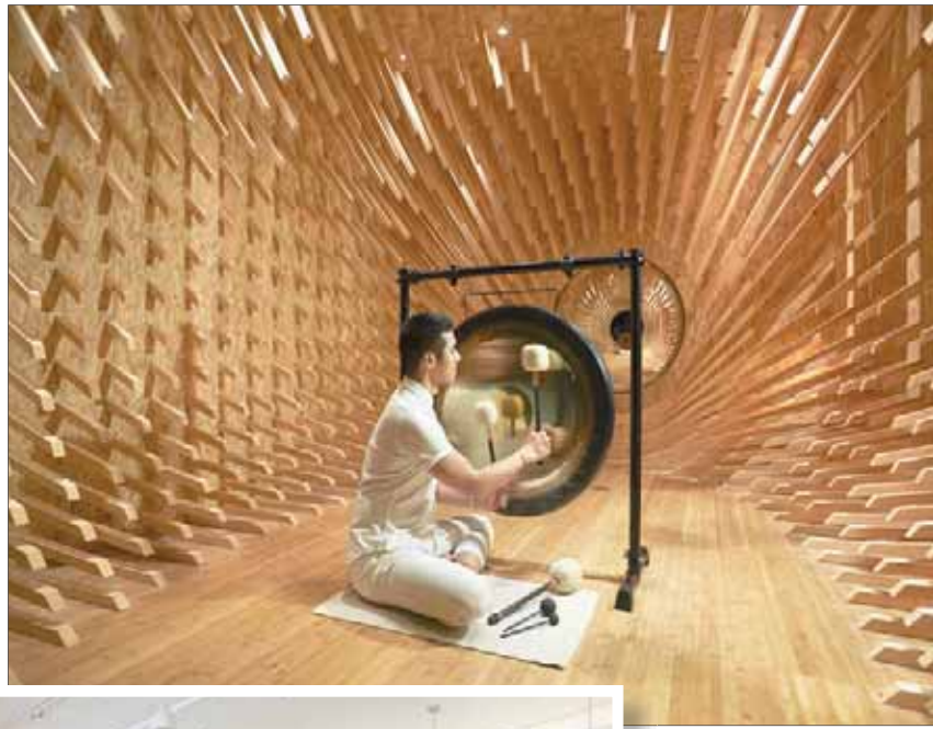
بجو فندق في أوكلاهوما سيتي يستضيف معرضاً فنياً

أكثر من 20 عاماً وجدت نفسى أعمال على صناعة هذه المنشآت البيئية الضخمة التي لا تستطيع بناءها لنفسى». ومن شأن أعماله وأعمال الفنانين الآخرين أن تسافر إلى مواقع أخرى تابعة لفنادق بينيسولا خلال السنوات القليلة القادمة، كما هو الحال مع معارض المتاحف.