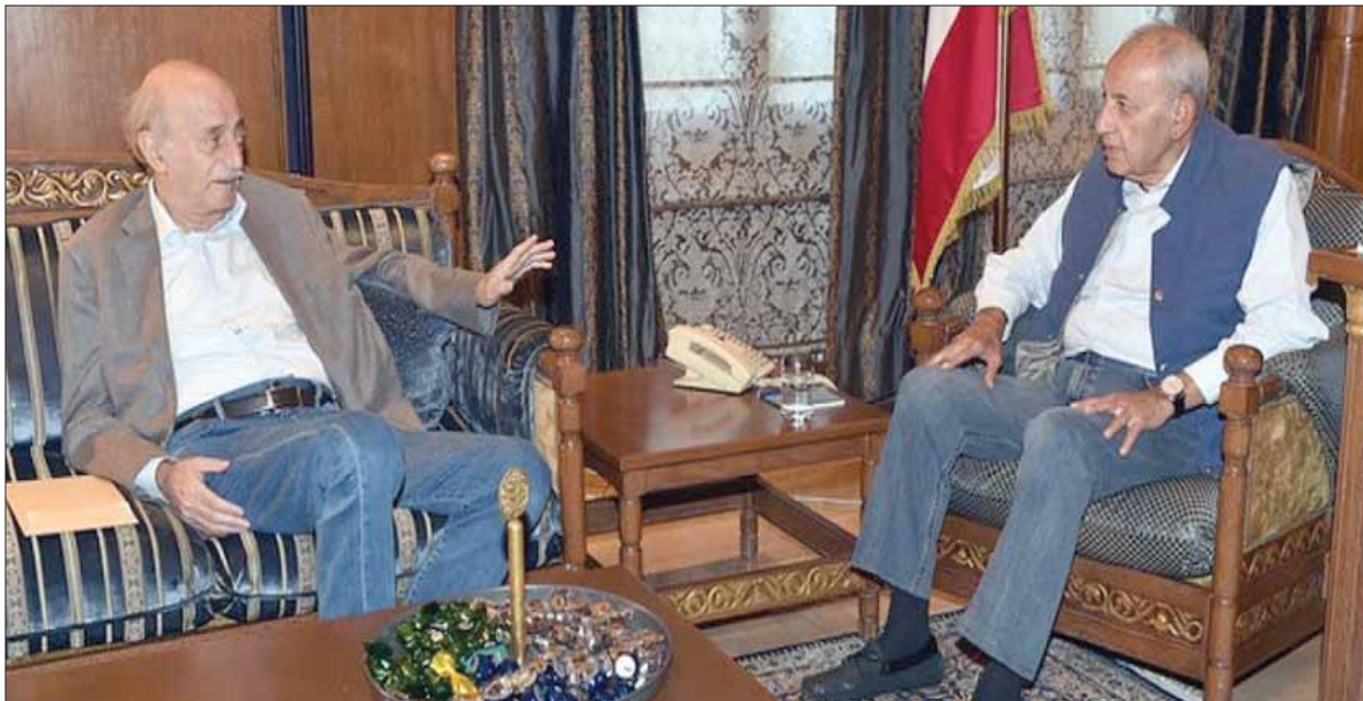
الرئيس بري مستقبلاً جنبلاط عقب حادثة الجبل

قال مصدر نيابتي بارز إنه لا يحدّد دعوة مجلس الوزراء لانعقاد ما لم تسبق دعوته تهيئة الأجواء لتحقيق مصالحة شاملة ولو على الطريقة «العشائرية»، لأن من دونها لا ضمانات بعدم في ظل ارتفاع منسوب التوتر واستئناف المحادثات الوزارية اليوم قبل الغد لأنه صاحب المصلحة في إعادة تفعيل العمل الحكومي.