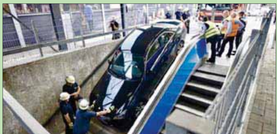
ميونيخ - لندن: «الشرق الأوسط»

الشركة الألمانية، بعد ظهر أمس الأحد، إن قائد السيارة (66 عاماً) خطط بين علامة المترو وعلامة «مكان متعدد الطوابق» لصف السيارات، فوجد نفسه ينزل بالسيارة على سلم المحطة، حسب وكالة الأنباء الألمانية (د.ب.أ).