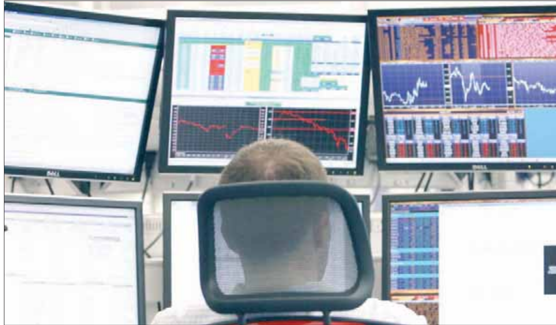
متعامل في البورصة الروسية للأوراق المالية في العاصمة موسكو

وبالمقابل حذر آخرون من احتمال تراجع حاد على الروبل مطلع الأسواق، فضلاً عن تداعيات سلبية على الاقتصاد الروسي على المدى المتوسط والبعيد، لأن العقوبات شملت الدين الروسي العام، رغم أنها لم تكن شديدة كما كان متوقعاً. أما العامل السلبي الآخر فهو أن هذه الحزمة تفرض قيوداً إضافية على التعاملات المالية بشكل عام مع المؤسسات الرسمية الروسية. وتشير بيانات رسمية إلى أن حصة المستثمرين الأمريكيين من إصدارات سندات الدين السيادي الروسي خلال العام الجاري بلغت 22,4 في المائة، بما في ذلك شراء المستثمرين الأمريكيين 29 في المائة من الإصدار الأخير لسندات الدين العام مستحقة السداد عام 2035.