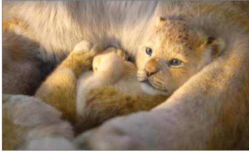
الشبل في حضن أبيه؛ لقطة من «ذا ليون كينغ»