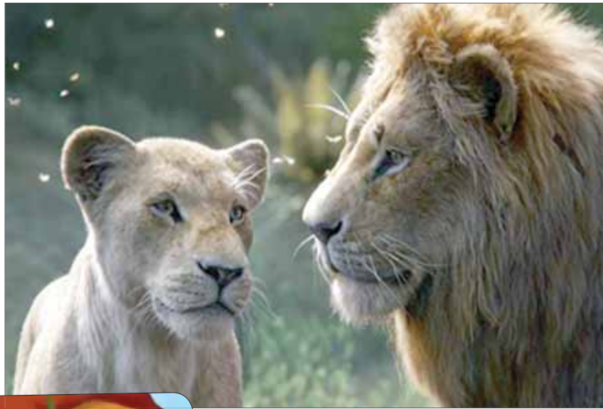
النسخة الجديدة من الفيلم

يونيفرسال وباراماونت اللتان تأسستا سنة 1912. من ثمّ تبعته شركتا ج.م.ج وكولومبيا سنة 1924. وتأسست شركة تونتيث سنشري فوكس سنة 1935. هذا لجانب العديد من شركات الصف الثاني مثل RKO و«ريجالبل» وشركات عرفت باسم «صف الفقراء» مثل «تيفاني بيكتشرز» و«استور بيكتشرز» و«مونوغرام». كون الشركات الأخرى صُنيت إنتاجاتها على السينما الحية فإن ذلك ترك المجال أمام ديزني للتخصص بالأفلام الكرتونية. لكن الشركة كانت من الصغر بالحجم بحيث انضمت عملياً، إلى استوديوهات الصف