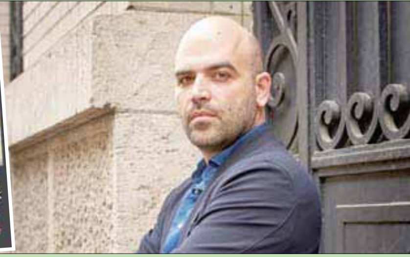
الكاتب روبرتو سافيانو أكثر المطوليين للمافيا

تسجلي على سافيانو أنه يجب التخطيط مسبقاً لجميع تحركاته، قبل يومين على الأقل، لإعطاء حرسه الشخصي الوقت لفحص الأماكن التي من المقرر أن يتوجه إليها. ويعني هذا الوضع المخيف أيضاً أن سافيانو لا يستطيع أن يركب دراجة، أو أن يقود سيارة أو دراجة نارية، ولا يمكنه أن تكون له ارتباطات منتظمة، مثل إعطاء دروس أو دورات أسبوعية، أو حتى الذهاب إلى السينما، إذا لم تحجز كاملة له وحده.