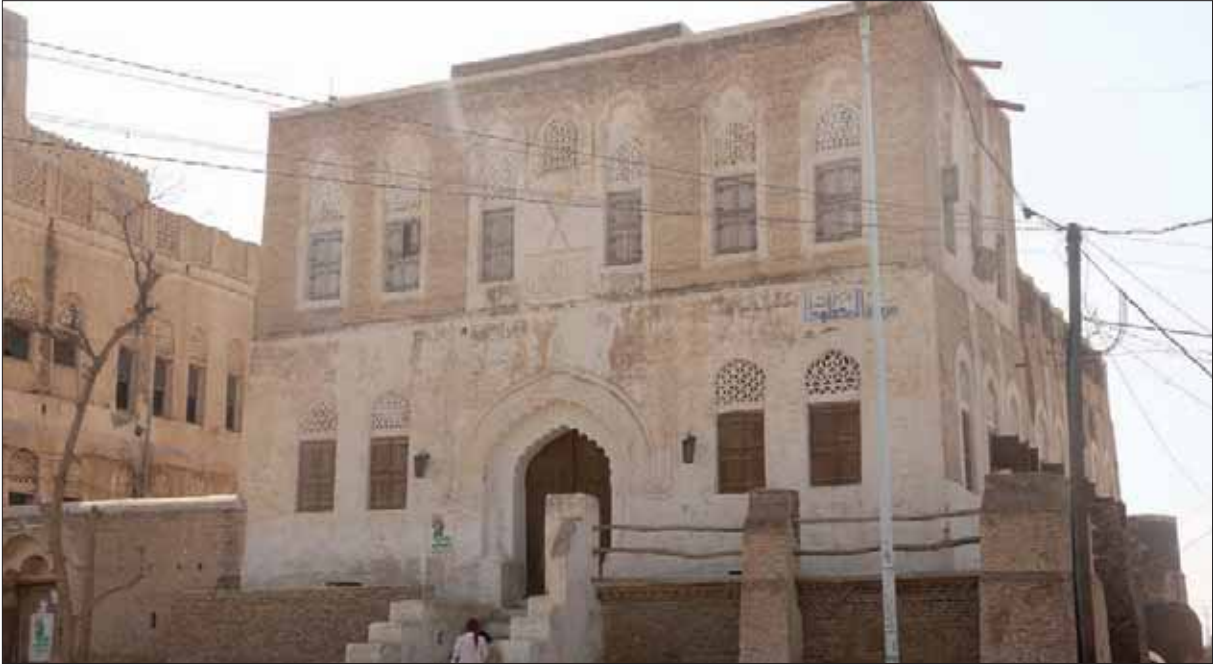
جانب من دار المخطوطات في زيد التابعة لمحافظة الحديدة

تسليمه في حين اختفى النصف الآخر». وأضاف «في 2014 تم اكتشاف 1250 مخطوطاً في ضريح أحد الأئمة بجامع صلاح الدين غرب صنعاء القديمة وتتميز بأنها مزخرفة، حتى أن بعضها موسى بالذهب، وحين نسال أين اختفت ولماذا لم توضع في المكتبة بزعمون أنه تحتاج إلى ترميم، رغم أن لجنة متخصصة كانت قامت بترميمها». وعلى نفس الصعيد يكشف باحث يمني متخصص بالآثار والمخطوطات اكتفى باسم «أبو