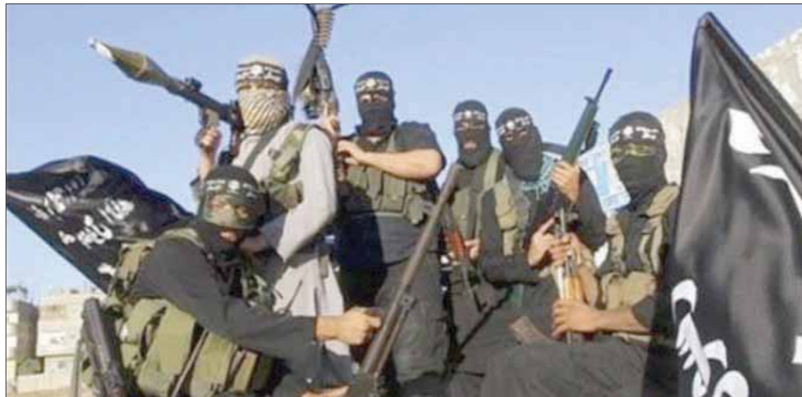
«دواعش» يحملون بالعودة مرة أخرى إلى سوريا والعراق (الشرق الأوسط)

خير دليل على مدى أهمية هذه المواقع للتنظيم ومؤيديه، الذين لم يستطيعوا الذهاب إلى أماكن تركزه الرئيسية في السابق؛ لكنهم تشبوا بأفكار التنظيم غير تؤولهن إلى فهم تعاليم الدين فهماً صحيحاً، وفي الوقت ذاته هن متحمسات للبحث في الدين ومعرفة حقائقه، الأمر الذي جعلهن