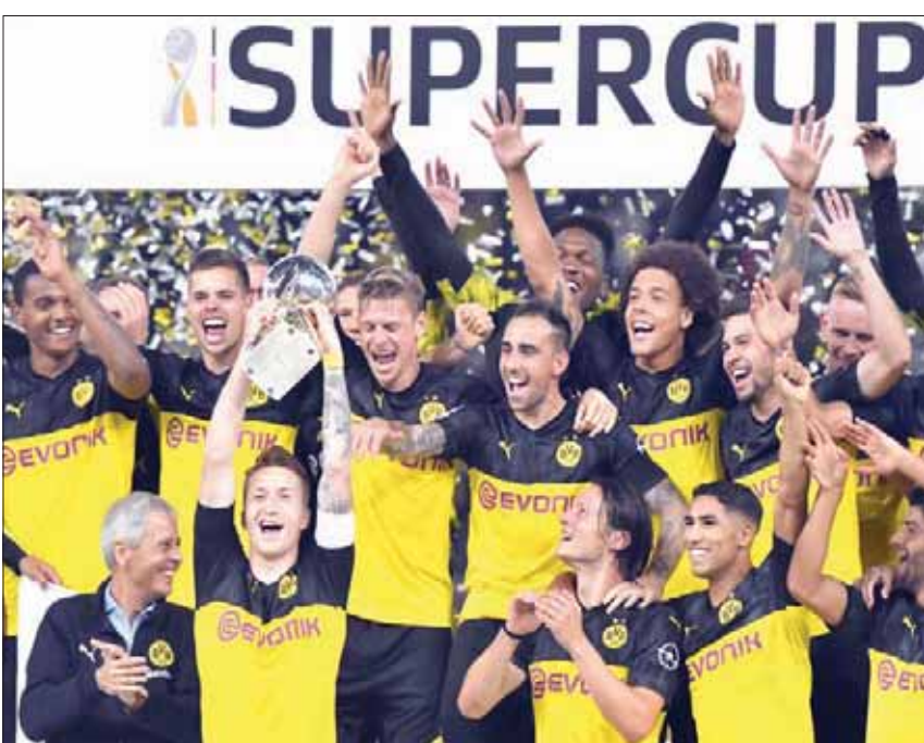
لاعبو دورتموند يحتفلون بالثتويج أبطالاً لكأس السوبر الألمانية

أما حارس بايرن وقائده مانويل نوير فقال: «اعتقد باننا قدما شوطاً أول جيداً. لكننا وضعنا دورتموند في أجواء المباراة من خلال ارتكابنا الأخطاء. لقد قدما لهم الكرات ولهذا السبب منيت شباكتنا بهدفين».