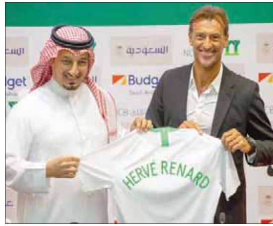
رينارد يحمل قميص الأخضر بعد توقيع العقد وإلى جانبه المسحل رئيس اتحاد الكرة

ومناسيب لقيادة الأخضر في المرحلة المقبلة.