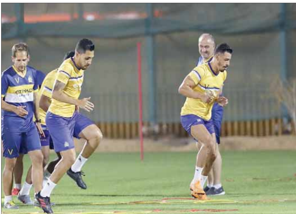
لاعبو النصر في تدريباتهم الأخيرة استعداداً للمباراة