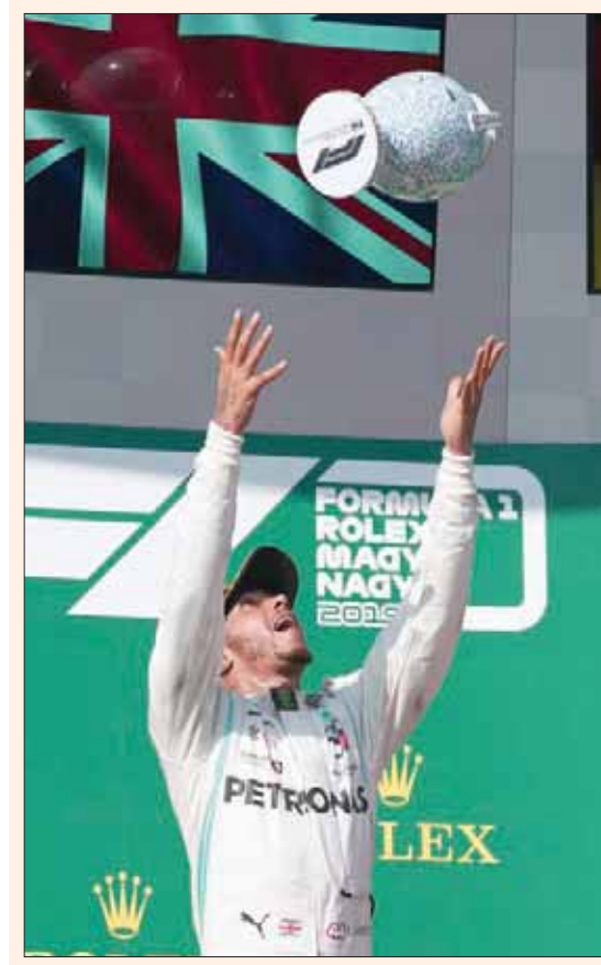
هاميلتون يحتفل بكأس سباق المجر

افتنص بطل العالم البريطاني لويس هاميلتون الفوز من سائق ريد بول الهولندي ماكس فيرستان، بفضل استراتيجية ناجحة لفريقه مرسيدس في سباق جائزة المجر الكبرى، المرحلة الثانية عشرة من بطولة العالم للفورمولا 1 على حلبة هنغارورينغ أمس. وهو الفوز الثامن هذا العام للسائق البريطاني والـ 81 في مسيرته، معززاً بفضل صدارته لترتيب البطولة. وتقدم بطل العالم خمس مرات على فيرستان المنطلق من الصدارة، فيما حل سائق فيراري الألماني سباستيان فيتيل رابعاً أمام زميله شارل لوكلير من موناكو.