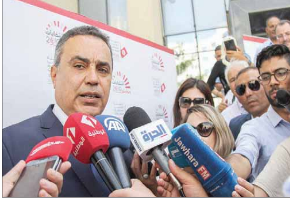
المهدي جمعة يتحدث إلى الصحافيين بعد ترشحه للرئاسة أمس

ومن المنتظر أن يقدم جمعة الهمامي القيادي اليساري البارز ترشحه إثر تصريح محسن النابيتي عضو «المجلس المركزي لتحالف الجبهة الشعبية» بأن الهمامي سيقدّم ترشحه، وأنه نجح في جمع نحو 20 ألفاً تزكية من التونسيين، وأنه يطمح لجمع نحو 50 ألف تزكية قبل خوض الاستحقاق الرئاسي، معتبراً أن الحصول على هذا العدد من التوقيعات يحمل عدد رسائلهم أن «التونسيين يتقنون كثيراً في مرشح (الجبهة الشعبية)» على حد قوله. وأكد النابيتي أن عملية جمع التوقيعات كانت عبارة عن استفتاء لثقة التونسيين في مرشح «الجبهة»، مؤكداً أنه اختار تقديم ترشحه