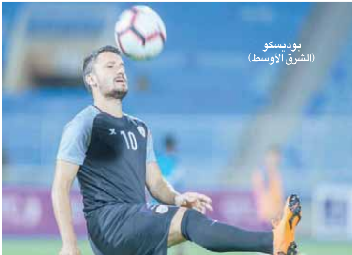
بوديسكو (الشرق الأوسط)

ويختتم الفريق الشبابي معسكره الخارجي في الثامن من شهر أغسطس (آب) الحالي، ونجح الفريق في الفوز بجميع مبارياته الودية التي لعبها خلال معسكره الحالي وأصبح الفريق جاهزاً لمنافسات الدوري السعودي للمحترفين حيث سيواجه في أولى مبارياته فريق الفتح يوم 24 أغسطس.