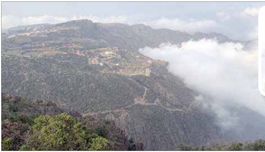
جبال السودة في منطقة عسير

وأكد مدني أن فعاليات موسم السودة أقيمت لتناسب كافة فئات المجتمع فهناك بطاقات الدخول اليومية للفعاليات ويمكن الحصول عليها سواء عن طريق الموقع الإلكتروني أو عند مدخل الفعاليات، وأيضا عبر نقاط البيع المخصصة مثل مدينة أبها، إلى جانب ذلك، هناك باقات متنوعة وتشمل تجربة شاملة لجميع الفعاليات الرياضية والترفيهية وأشياء أخرى مثل مشاركة نسائية كبيرة، حيث الإقبال من بنات المكان واحترافيتهم في جميع المستويات فهناك الإداريات في المناصب القيادية إضافة إلى الموهوبات في فن «القط العسيري»، علاوة على الطابقيات الشغوفات العلامات بدوام جزئي.