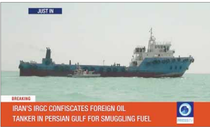
قناة إيرانية تبث أول صور لناقلة النفط بعد إعلان الحرس الثوري احتجاجاً أمس (رويترز)

الناقلات خلال الثمانينات، لكن في السنوات القليلة الماضية ارتبط اسمها بعملية احتجاز 10 من البحرية الأميركية عشية تنفيذ الاتفاق النووي في منتصف يناير (كانون الثاني) 2016، الأزمة التي جرى احتواؤها بعد تواصل مباشر بين وزير الخارجية الأميركي السابق جون كيري ووزير الخارجية الإيراني محمد جواد ظريف.