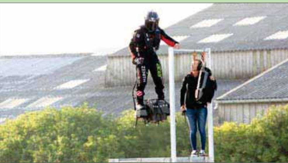
الفرنسي فرانكي زاباتا لحظة الانطلاق

الذي حلق بين سفينتين مرتدياً سترة نفاثة. وكان أكبر تحد واجهه زاباتا خلال رحلته يتمثل في إعادة التزود بالوقود من حقيبة ظهر أخرى مما يتطلب هبوطه فوق منصة على قارب. واحتل توازن المخترع الفرنسي عندما حاول فعل ذلك في المحاولة الأولى فسقط لكنه استخدم هذه المرة قارباً أكبر ومنصة أكبر هذه المرة.