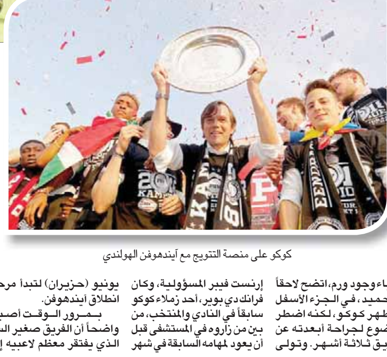
كوكو على منصة التتويج مع آيندهوفن الهولندي

لندن: بين هيشر في المركز 10ل سادات صفوف جماهيره موجة قلق عارم. في هذا الصدد، قال بروبر الذي لعب لاحقاً تحت قيادة كوكو في آيندهوفن على مدار موسمين قبل انتقاله إلى برايتون عام 2017: «كانت الجماهير غاضبة للغاية، وكانوا على وشك اقتحام الملعب. وبالنسبة لنا، بدا الأمر جنونياً أن نفوز بعيداً عن أرضنا أمام آيندهوفن بنتيجة 2 - 0. من الخطأ الأول عندما حل مكان فرانك لامبارد في تدريب ديربي كاونتي، داخل آيندهوفن، فإن كوكو بسبعة بطولات دوري (أربعة منها كان يرتدي خلالها شارة قائد الفريق وثلاثة منها خلال توليه منصب مدرب الفريق لمدة خمس سنوات). ومع هذا، فإن سمعته الصاعدة كمدرّب كفاءه تضررت بشدة بسبب الفترة الكارثية التي قضاها في فنارغشة التركي العام الماضي واستمرت 98 يوماً فقط. ومع هذا، تعتبر هذه الفترة استثناءً في سيرة ذاتية يملك فيها النجاح الطابع العام لها، تماماً مثلما الحال مع سلفه. جدير بالذكر أن آيندهوفن ظل بعيداً عن الفوز ببطولة الدوري ست سنوات حتى تولى كوكو قيادته إلى عدد من الانتصارات المتتالية، بعدما احتفل الموسم العاصب الأول له عام 2013 - 2014 والذي أنهى خلاله آيندهوفن الدوري في المركز الرابع، متجاوزاً عن أياكس السد العتيق بفارق 12 نقطة. ومضى كوكو دونما هزيمة في أول سبعة مباريات له، وفاز في الثلاثة الأولى، لكن استمر آيندهوفن بعد ذلك شهرين في بطولة الدوري دون فوز وخرج من دور المجموعات ببطولة دوري أوروبا. بحلول وقت الهزيمة التي مني بها على أرضه أمام فينتسه آرنيهم بنتيجة 2 - 0 قبل العطلة الشتوية، وهي مباراة سجل خلالها ديفي بروبر هدفين، كان آيندهوفن