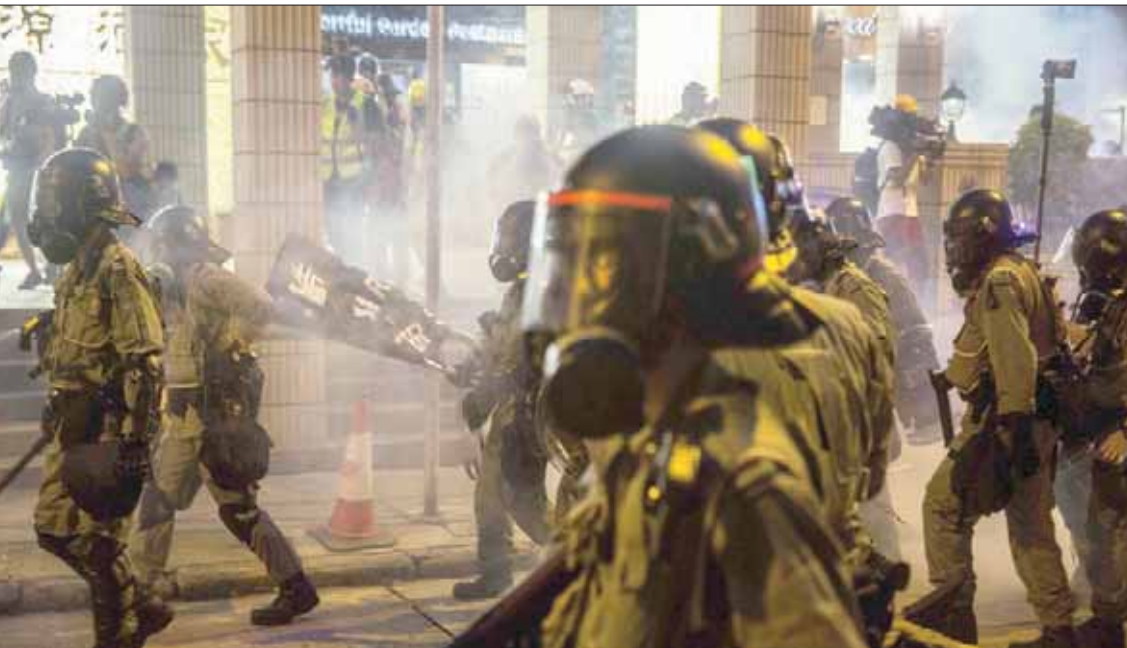
قوات مكافحة الشغب تطلق الغاز المسيل للدموع في هونغ كونغ أمس

استأنف متظاهرون ينادون بالحريّة، أمس، مظاهراتهم في شوارع هونغ كونغ لواصلت ضغوطهم على السلطات، غداة صدامات مع الشرطة في أحد المستعمرات البريطانية السابقة. وتشهد المدينة الكبيرة في جنوب الصين، والتي تجتاز أسوأ أزمة سياسية منذ أعادتها لندن في 1997، مظاهرات كثيفة خلال تسع عطلات نهاية أسبوع متتالية، وغالباً ما تلقى اشتباكات بين جماعات متشددة وقوى الأمن. ويعد ظهر أمس، نُظمت مظاهرات قبل إضراب عام اليوم، وسار المتظاهرون بالألاف في حي تسونغ كون أو السكتي (شرق)، بينما كان من المقرر أن تنتهي الثانية في حديقة عامة