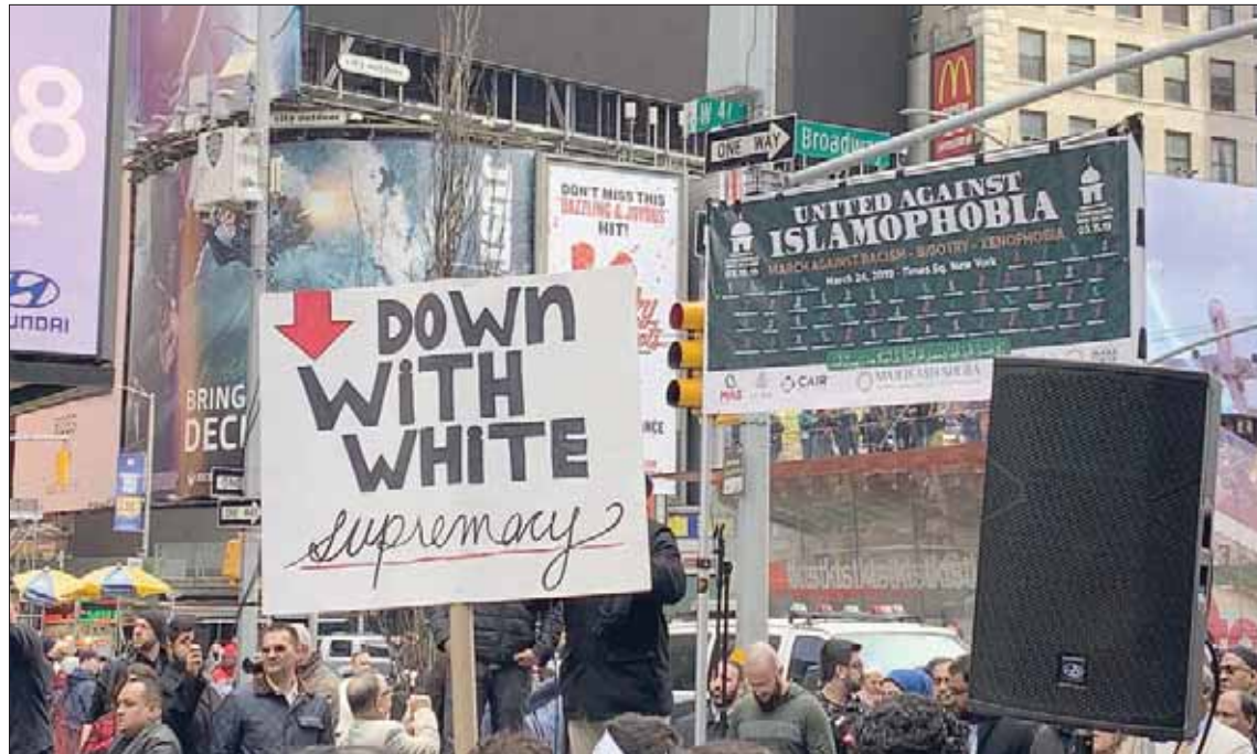
مظاهرات أميركية ضد تصاعد مد اليمين المتطرف و«الإسلاموفوبيا» في نيويورك مارس الماضي

اليمين المتطرف تزايد في أعقاب فوز باراك أوباما، كأول رئيس من أصول أفريقية للولايات المتحدة، حيث تصاعدت نظرية المؤامرة والتشكيك في جنسيته والدين الذي ينتمي إليه،