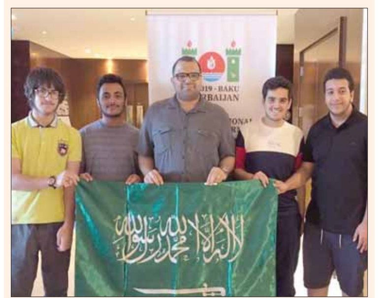
الفريق السعودي المشارك في الدورة

إشراف متخصصين في المجال المعلوماتية. يذكر أن الأولمبياد الدولي للمعلوماتية أكبر مسابقة دولية سنوية في مجال المعلوماتية، ويستهدف الطلاب دون سن العشرين، وتقام في إحدى الدول الأعضاء في اللجنة الدولية للمعلوماتية. وكانت أول دورة أقيمت للأولمبياد في بلغاريا عام 1989 برعاية اليونسكو والاتحاد الدولي لمعالجة المعلومات IFIP، وهي واحدة من أولمبيادات العلوم الدولية الخمسة التي يتم تنظيمها حول العالم، ومن أعرق مسابقات علوم الحاسب الآلي، كما تعد ثاني أكبر مسابقات الأولمبياد بعد أولمبياد الرياضيات الدولي من حيث عدد الدول المشاركة.