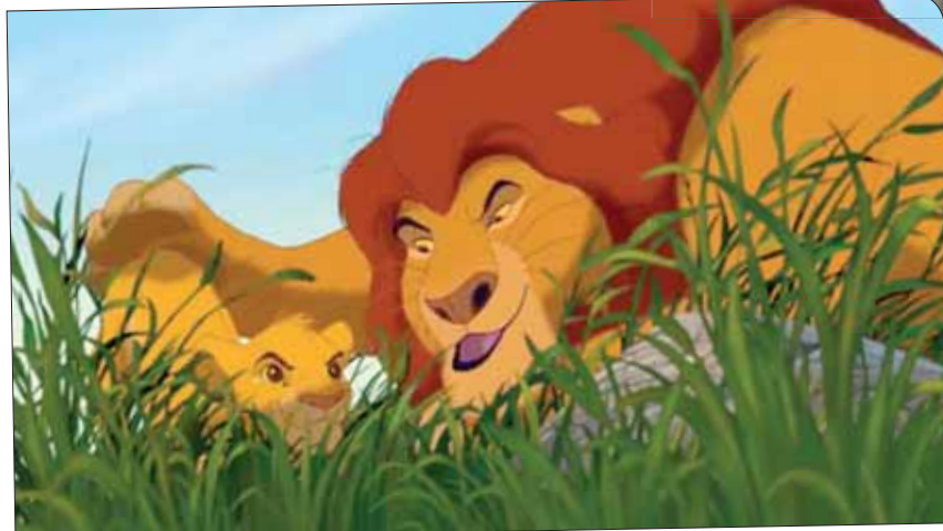
النسخة القديمة من الفيلم

أفريقية. وكل ذلك تم بالتخصص في سينما الأنيميشن والوصول بعدها إلى المركز المالي الذي سمح له بالاتفاق مع شركة مارفل لجلات الكوميكس بالعمل معاً. بذلك استولى على قرار المشاهدين بتأمين أكثر نوعين من الإنتاجات شيوعاً بين جمهور اليوم. «ذا ليون كينغ» هو حصيلته كل هذه السنوات لا كجزء تاريخي محدد بل بالنظر إلى ما عرفته السينما من تطورات تقنية باتت تلتهم كل ما عداها من ضروب العمل وفنون الإبداع.