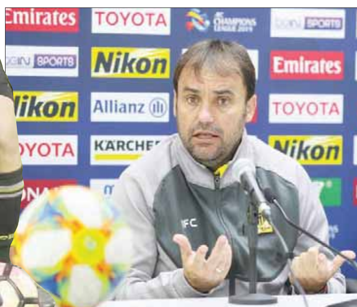
سبييرا خلال المؤتمر الصحفي أمس (الشرق الأوسط)