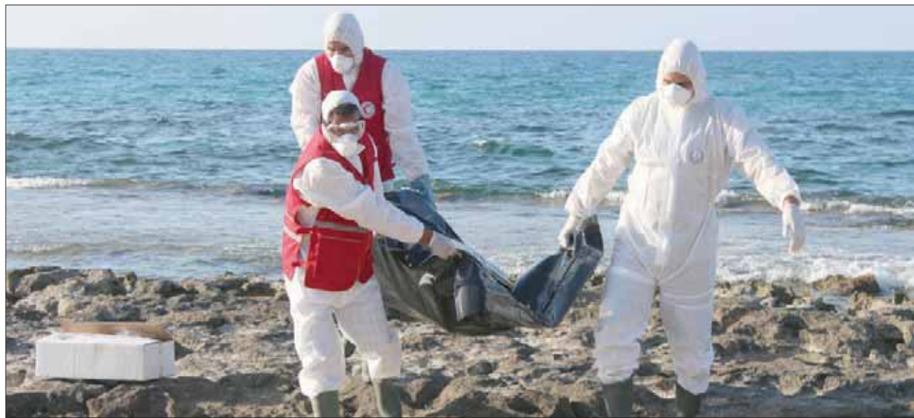
خفر السواحل الليبي ينتشل جثث مهاجرين غرق زورهم في عرض السواحل الليبية ليلة أول من أمس

ذاته أعضاء ورؤساء البعثات الدبلوماسية في الخارج للوقوف صفاً واحداً لصحة الوطن.