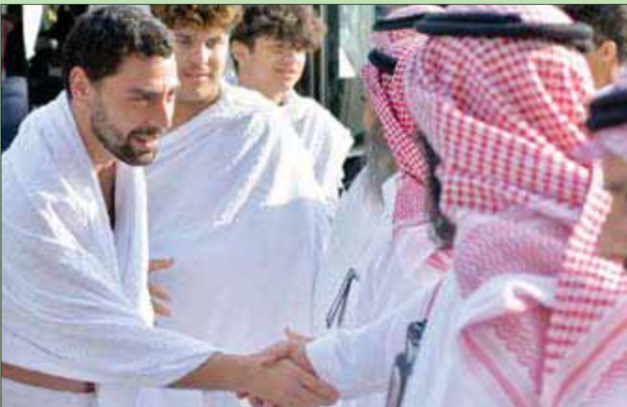
ترحيب كبير كان في استقبال ذوي مصابي وشهداء حادث نيوزيلندا الإرهابي لدى وصولهم للسعودية