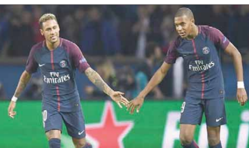
هل تتواصل شراكة مبابي ونيمار في سان جيرمان؟

ذلك الحفل، وأنا سرقت النجومية؛ لكن بطريقة سلبية». وأضاف: «المشجعون