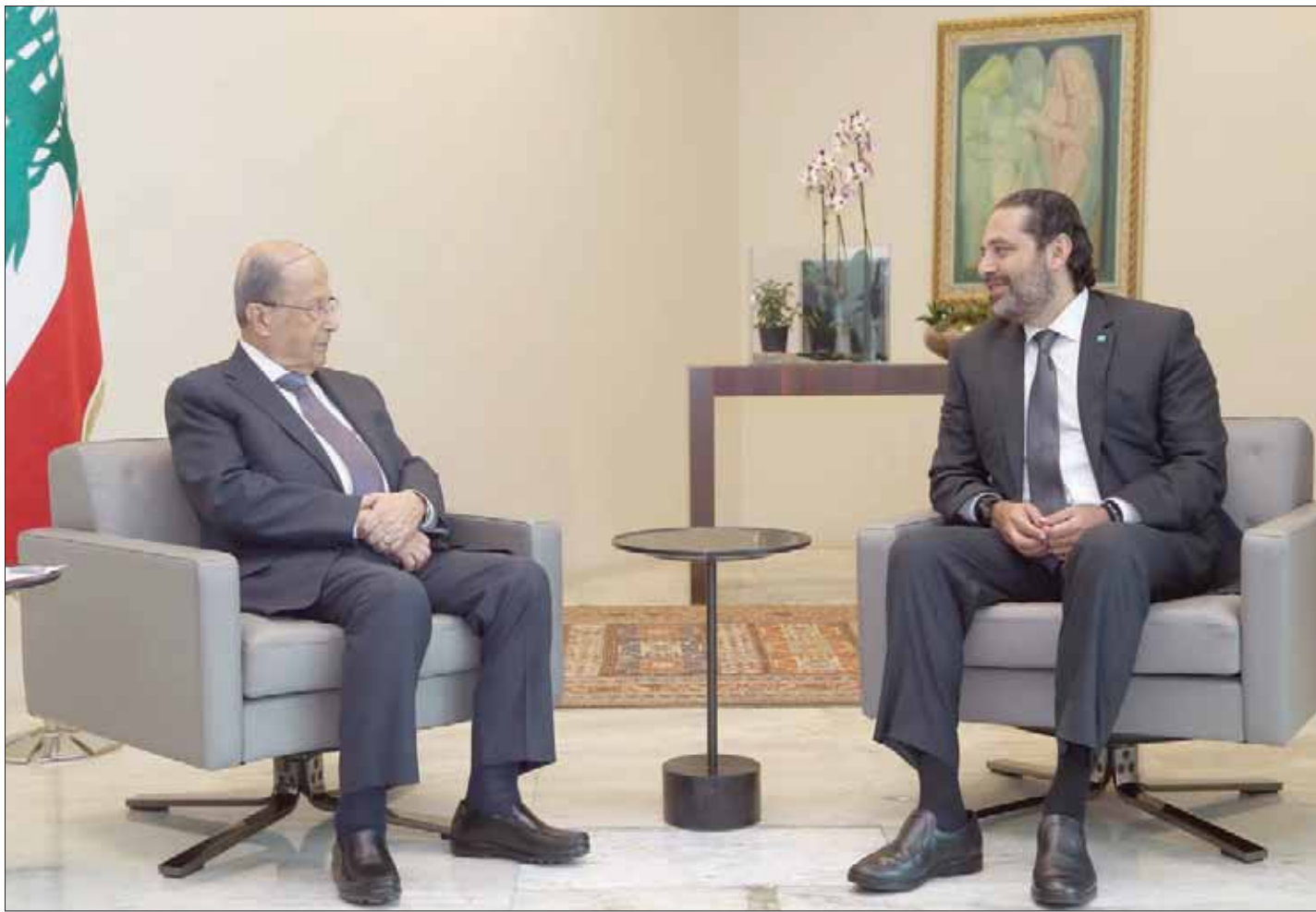
من لقاء سابق بين الرئيسين عون والحريري (الداخلي ونهرا)

بإدارة الرئيس اللبناني ميشال عون للاتصال برئيس الحكومة سعد الحريري، طالباً منه الدعوة إلى عقد مجلس الوزراء في أقرب وقت ممكن، من منطلق أن مجلس الوزراء مجتمعاً هو السلطة التي تطرح أمامها كل الخلافات والإشكالات السياسية والأمنية، وهو ما دفع مصدرًا حكومياً للتأكيد أن «الحريري يدرك صلاحياته جيداً». وأفادت قناة «إل بي سي» بأنه بعد بلوغ الوضع حداً خطيراً من تعطيل السلطة الإجرائية ومصالح الناس والخدمات والإدارات والمؤسسات، ويعد استنفاد كل الحلول والمبادرات بشأن حالة الجبل، بادر الرئيس عون، من موقعه وصلاحياته، لا سيما الفقرة 12 من المادة 53 من الدستور، إلى الاتصال بالحريري، طالباً منه الدعوة إلى عقد مجلس الوزراء في أقرب وقت ممكن، من منطلق أن مجلس الوزراء مجتمعاً هو السلطة التي تطرح أمامها كل الخلافات والإشكالات السياسية والأمنية، ووعده رئيس الحكومة بعقد جلسة في بدايات الأسبوع المقبل.