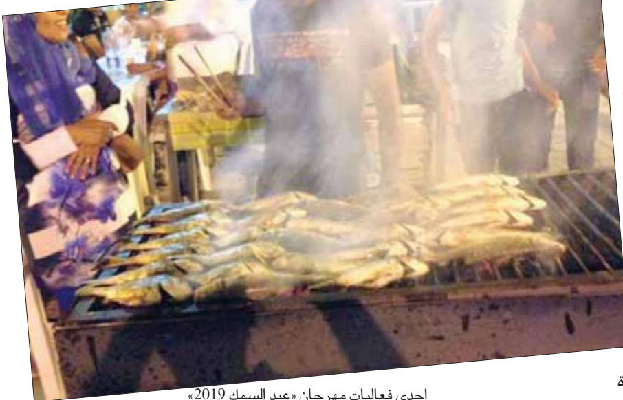
إحدى فعاليات مهرجان «عيد السمك» 2019