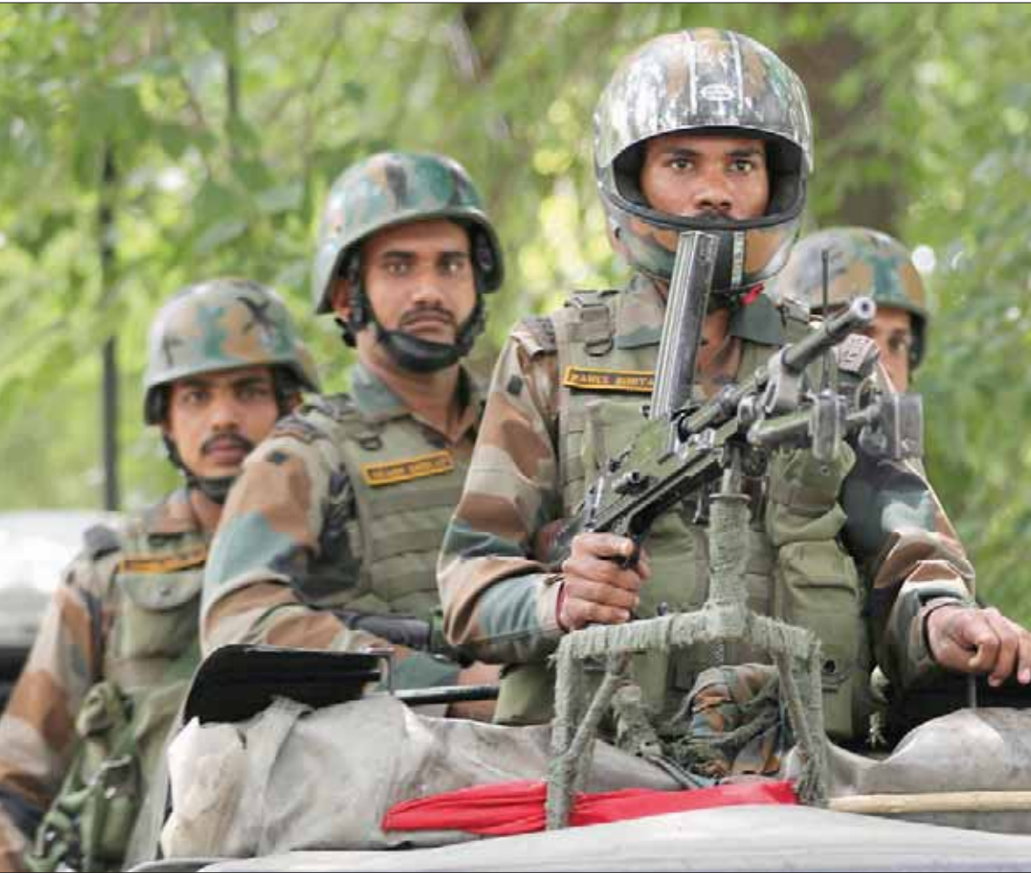
خاضت الجارتان التويتان حربين في النزاع على كشمير منذ استقلالهما عن الحكم البريطاني عام 1947

وأشار مسؤول رفيع المستوى في الخارجية الأميركية، إلى أن عرض وساطة ترنم لحل النزاع في كشمير، يأتي ضمن رغبة الولايات المتحدة في تحسين العلاقات بين الهند وباكستان. وأضاف: «نحن نرى أن قضية كشمير ثنائية بين الهند وباكستان، لكن هناك فرص إذا قامت باكستان بعدد من إجراءات بناء الثقة ومكافحة الإرهاب، وخطت خطوات نحو حوار منمثر، فإننا في الولايات المتحدة مستعدون للمساعدة، إن طلب منا طرفا النزاع لذلك».