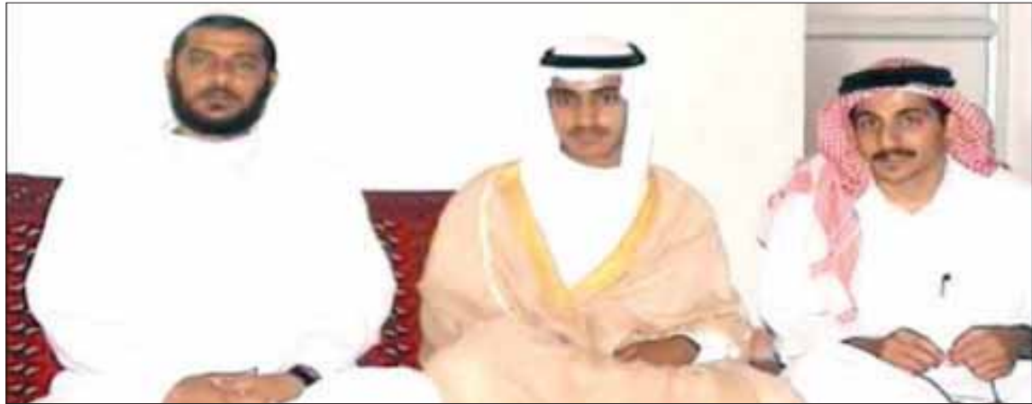
حمزة بن لابن (وسط) خلال حفل زواجه من ابنة ابو محمد المصري (يسار) قيادي القاعدة

عندما وضعت وزارة الخارجية مكافأة قدرها مليون دولار للحصول على معلومات حول مكان وجوده، اعتقد مسؤولو الاستخبارات أنه قد مات. ويقف المسؤولون الأميركيون بدرجة كبيرة في أنه قد مات حتى لو بقيت الملباسات الدقيقة لوفاته غير معلومة. ولم يصدر عن تنظيم «القاعدة» أي تأكيد لمقتل حمزة، رغم أنه عادة ما يعلن مثل تلك الأنباء بعد أن يضيف اسم «شهيد» قبل اسم القتيل، ولم يصدر عنه نفي كذلك. وقال أحد المسؤولين الأميركيين إن تنظيم «القاعدة» أبقي نيا مقتله سراً خشية أن يضر ذلك بعمليات جمع الأموال.