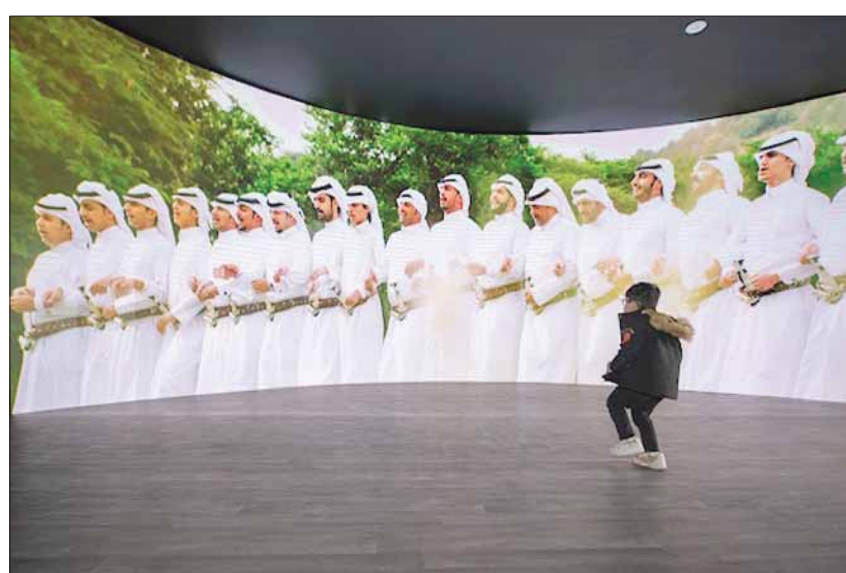
معرض «الخطوة» يشتمل على صور ومقاطع مرئية تعكس جميعها الثقافة الشعبية لرقصة الخطوة