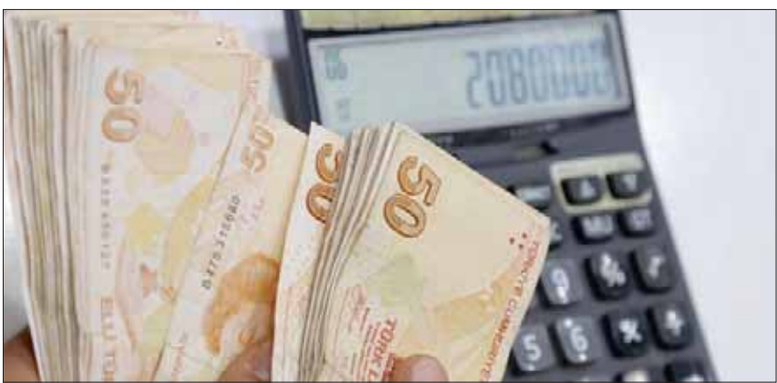
رفضت الحكومة التركية التدخل لمساعدة البنوك في تغطية الخسائر الناتجة عن القروض المتعثرة (رويترز)

حزمة تصدر نتجة الأمور إلى ما هو أسوأ». وتشد المعارضة التركي على «ضرورة تدوير عجلات الاقتصاد في أقرب وقت ممكن، لكن الشرط الأول لتحقيق ذلك هو تحقيق سياسات حكومة اردوغان، وطريقة تعاملها مع الملف الاقتصادي، وما أسفرت عنه من أزمة اقتصادية كبيرة تشهدها البلاد منذ فترة.