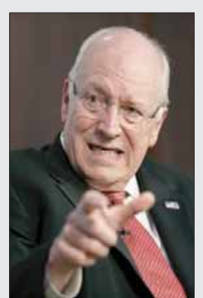
ريتشارد «ديك» تشيني

● روبرت مكنمارا. وزير الدفاع الثامن، صاحب أطول مدة أمضاها وزير للدفاع، وهي ثماني سنوات. ولد عام 1916، وتوفي عام 2009. وخدم في المنصب من عام 1961 إلى 1968، إبان عهدي الرئيسين الديمقراطي جون كينيدي وليندون جونسون. ولقد لعب مكنمارا دوراً رئيساً في تصعيد تدخل الولايات المتحدة في حرب فيتنام، وكان مسؤولاً