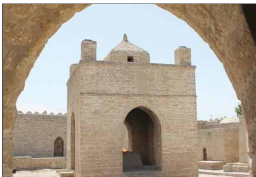
مقام النبي هارون في البتراء

خطورة ظهورهم بمظاهر دينية قد تستفز الأردنيين، وبالتالي فتح باب الاحتمالات على خطورة