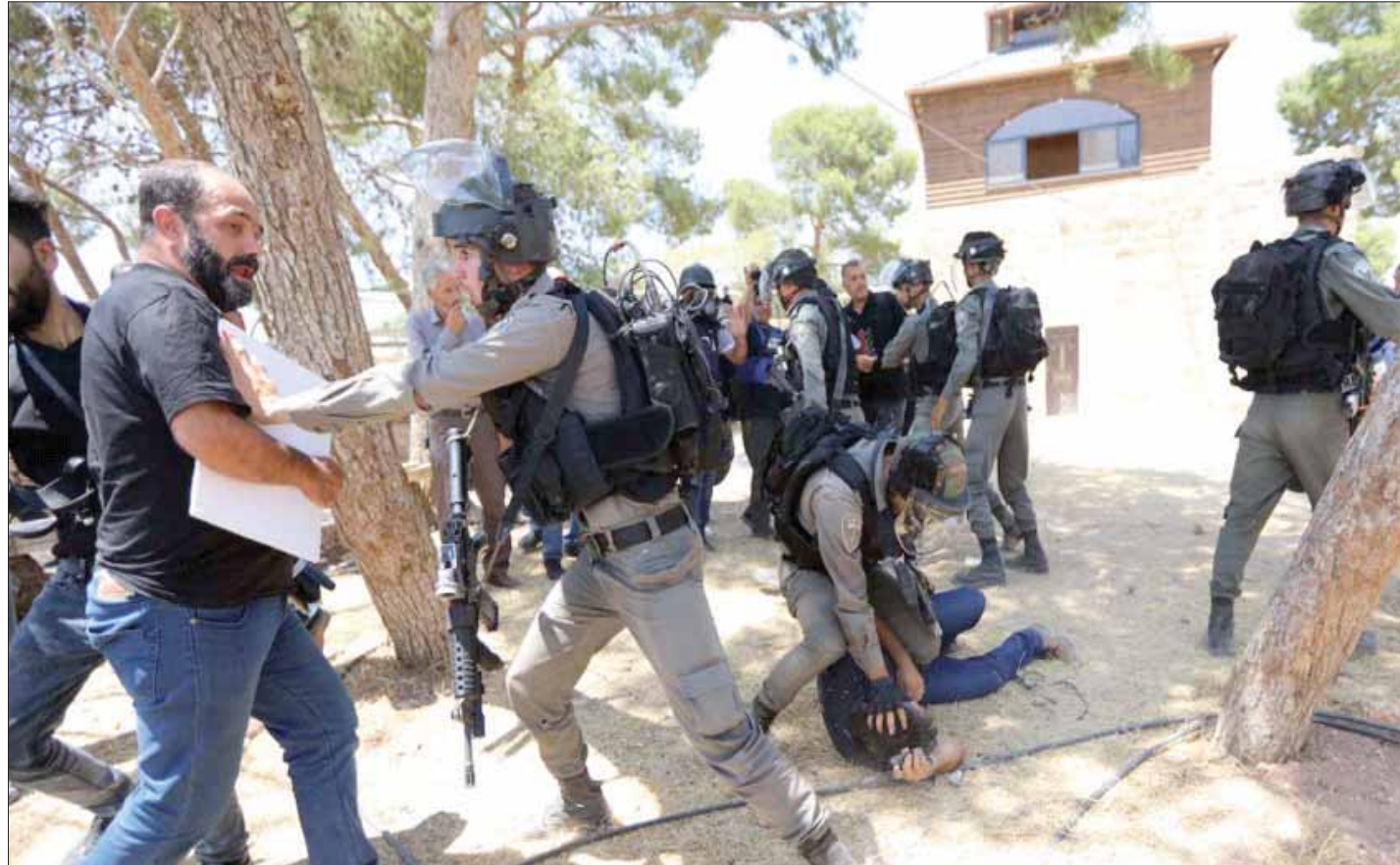
عشرات حالات الاختناق بالغاز والاعتداء على صحافي واعتقال مواطن في وادي الحمص