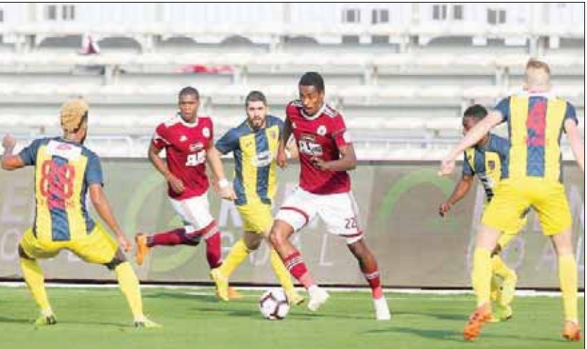
لوائح تسجيل الهواة أثارت الكثير من الجدل بين الأندية السعودية في السنوات الأخيرة (الشرق الأوسط)

فيما يخص تسجيل لاعبي هواة خارج فترتي التسجيل الرسمية، لتتعلق عدة أندية مع نادي الهلال في هذا الشأن إلا أن اتحاد كرة القدم لجانه القضائية قبل هذه الاحتجاجات شكلاً وتم رفضها موضوعاً. واعتمد اتحاد كرة القدم السعودي مجموعة من التعديلات في لائحة الاحتراف وأوضاع اللاعبين يأتي أبرزها إعادة قائمة الاستثمار بصورة مؤقتة وذلك حتى نهاية فترة التسجيل الثانية للموسم الرياضي الحالي، وكذلك منع التسجيل الثانية للموسم الرياضي الحالي، وكذلك منع لاعبي هواة في دوري الدرجة الممتازة.