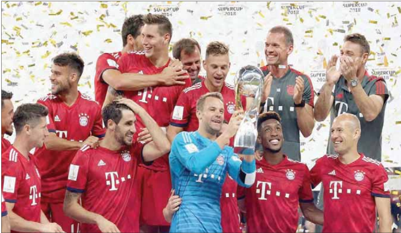
بايرن ميونيخ حامل لقب السوبر الألماني الموسم الماضي (الشرق الأوسط)

بتحفظه استخدام الخبرة الأكثر هدوءاً في هذا الصدد وطالب فرقة بان تتابع الأفعال الأقوال «فقد لعبنا موسماً جيداً للغاية في العام الماضي برصيد 76 نقطة، ولذلك نقول هذا العام إننا نستلعب على اللقب، لكن علينا أن نحلل كل شيء، كما علينا ألا نتحدث بشكل أكثر من اللازم».