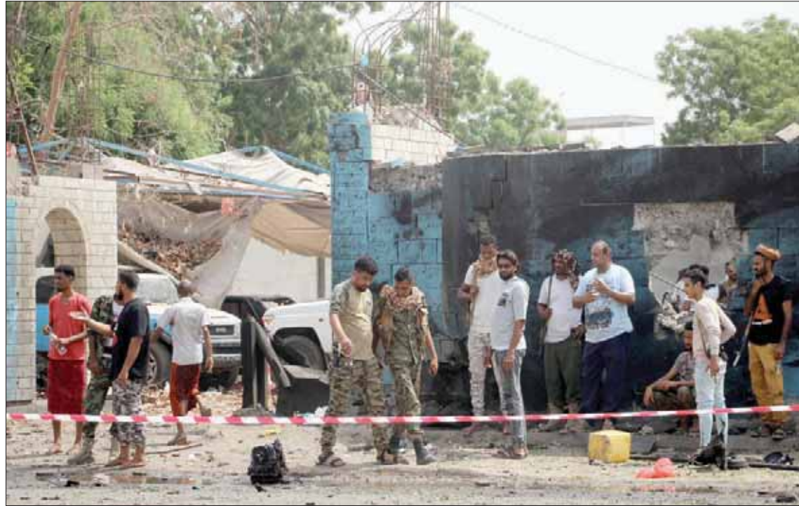
يمنيون يتفحصون بقايا التفجير الإرهابي الذي تبناه تنظيم «داعش» في عدن الخميس

إلى وكر العناصر الإرهابية والقضاء عليها نهائياً. كما ناقش الاجتماع - وفق وكالة «سبا» الحكومية - تداعيات الأحداث التي طرأت مجدداً في مديرية المحفد شرق محافظة أبين والتي نشطت فيها العناصر الإرهابية لتنظيم «القاعدة»، وشنها هجمات على معسكرات ونقاط الحزام الأمني. وأكد الاجتماع «تفعيل غرفة عمليات مشتركة يتم من خلالها الاطلاع على مجمل تداعيات الأوضاع ووضع البات بالتعاون والعمل المشترك لما من شأنه التغلب على كل المشكلات وإحكام السيطرة الأمنية واستتباب الأمن والاستقرار»، وأقر «تشكيل لجنة تحقيق في حيثيات العمليتين الإرهابيتين في عدن ولجنة لحصر الأضرار البشرية والمادية في معسكر الجلاء وشرطة الشيخ عثمان وتقديم الدعم اللازم لآسر الشهداء والجرحى والتكفل بعلاجهم ومنحهم التعويض اللازم».