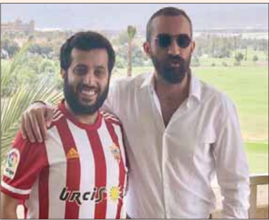
تركي آل الشيخ بقميص أليريا بعد عقد الصفقة

الرياض، الشرق الأوسط اشترى تركي آل الشيخ، رئيس مجلس إدارة الهيئة العامة للترفيه السعودية، نادي الميريا الإسباني الذي ينافس في الدرجة الثانية، بحسب ما أعلنه الطرفان الجمعة. وكتب النادي الأندلسي، في حسابه على موقع «تويتر»: «نرحب بالملك الجديد المستثمر تركي آل الشيخ»، فيما غرد الأخير مع صورة يرتدي فيها قميص النادي الأحمر والأبيض: «مغامرة جديدة، ادعوا لي». وأشارت الأنباء إلى أن قيمة استحواذ آل الشيخ على الميريا بلغت 20 مليون يورو، إضافة إلى 7 ملايين لتسوية ديونه. ونشر النادي فيديو لآل الشيخ يغادر مقر النادي وحوله بعض الصحفيين، وصورة له مع المدير العام الجديد للنادي المصري محمد العاصي. وكان آل الشيخ قد نشر صورة له مع البرتغالي بيدرو إيمانويل الذي قاد فريق التعاون السعودي إلى المركز الثالث في الموسم المنصرم، علق عليها: «نقاش عن مشروع قريب»، ليكون إيمانويل (44 عاماً) مرشحاً لخلافة المدرب أوسكار فرنانديز. كما غرد قائلاً: «مغامرة جديدة... ادعوا لي». وأضاف النادي الإسباني أن الرئيس السابق للهيئة العامة للرياضة خصص 200 ألف يورو لدعم مؤسسة الميريا المسؤولة عن فريق الاحتياجات الخاصة. وكان آل الشيخ، الرئيس التنفيذي السابق للنادي الأهلي المصري، قد باع حصته أخيراً في نادي «برامبيتن» المصري (الأسبوعي سابقاً)، بعد قيادته إلى المركز الثالث في الدوري، وراء