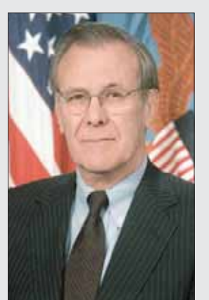
ريتشارد «ديك» تشيني

● دونالد رامسفيلد. ولد عام 1932، وكان أصغر من يتولى هذا المنصب، وثاني أطول من يشغله أيضاً. شغل منصب وزير الدفاع الثالث عشر في عهد الرئيس جيرالد فورد من عام 1975 إلى 1977، ووزير الدفاع الحادي والعشرين في عهد جورج بوش «الابن» من عام 2001 إلى 2006. عمل على تحديث وإعادة هيكلة الجيش الأميركي للقرن 21، ولعب دوراً محورياً في الرد على هجمات 11 سبتمبر (أيلول)، وفي الحربين اللاحقتين في أفغانستان والعراق. وأثار الجدل حول