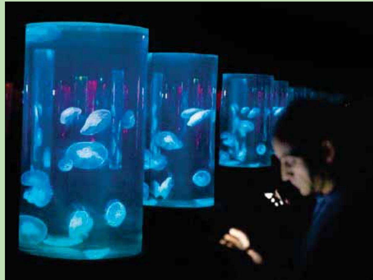
قنديل البحر النادر الذي عرض داخل معرض أكواريوم «تو أوشنز» في ميناء كيب تاون بجنوب أفريقيا