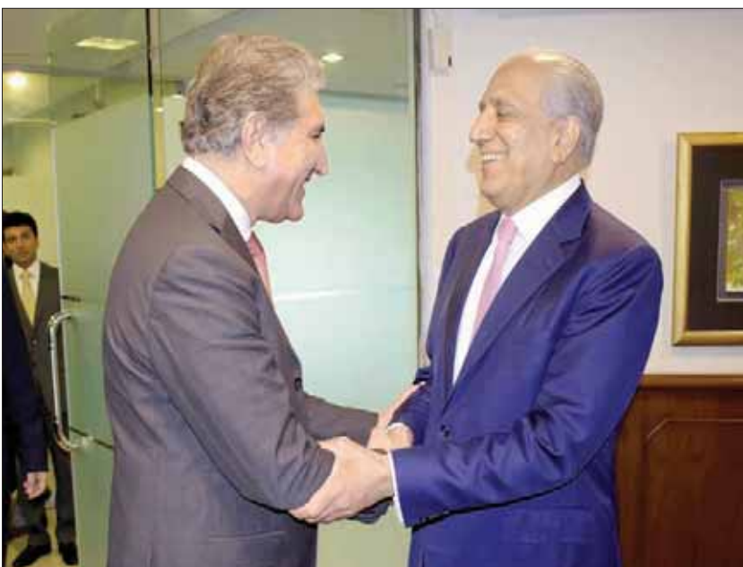
زلمي خليل زاد الممثل الأميركي الخاص للمصالحة في أفغانستان (يمين) مع وزير الخارجية الباكستاني شاه قريشي في إسلام آباد

واشنطن، «الشرق الأوسط» تستعد إدارة الرئيس الأميركي دونالد ترمب لسحب الآلاف من الجنود الأميركيين من أفغانستان، كجزء من صفقة مبدئية مع «طالبان» لإنهاء الحرب المستمرة منذ 18 عاماً. وقال مسؤولون بالإدارة الأميركية إن المفاوضات التي قادها السفير زلمي خليل زاد منذ عدة أشهر توصلت إلى اتفاقات مبدئية، تتطلب أن تبدأ حركة طالبان في التفاوض على اتفاق سلام مباشرة مع الحكومة الأفغانية، مقابل أن يتم تخفيض عدد القوات الأميركية في البلاد بشكل تدريجي من 14 ألف جندي إلى 9 آلاف جندي، ثم 8 آلاف جندي. ويبدى المسؤولون الأميركيون تفاؤلاً بإمكانية التوصل إلى اتفاق قبل إجراء الانتخابات الرئاسية الأفغانية في سبتمبر (أيلول) المقبل، وشدد المسؤولون على أنهم حذروا قادة «طالبان» من أي تأخير في تنفيذ الاتفاق، وإن هناك كثيراً من التحديات التي لا تزال قائمة.