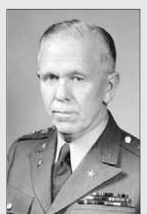
الجنرال جورج مارشال