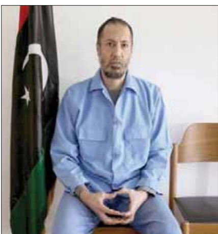
الساعدي القذافي بغياب السجن

الندرج إلى بلاده في مارس (آذار) 2014، رغم وعود سابقة من سلطات طرابلس بالإفراج عنه.