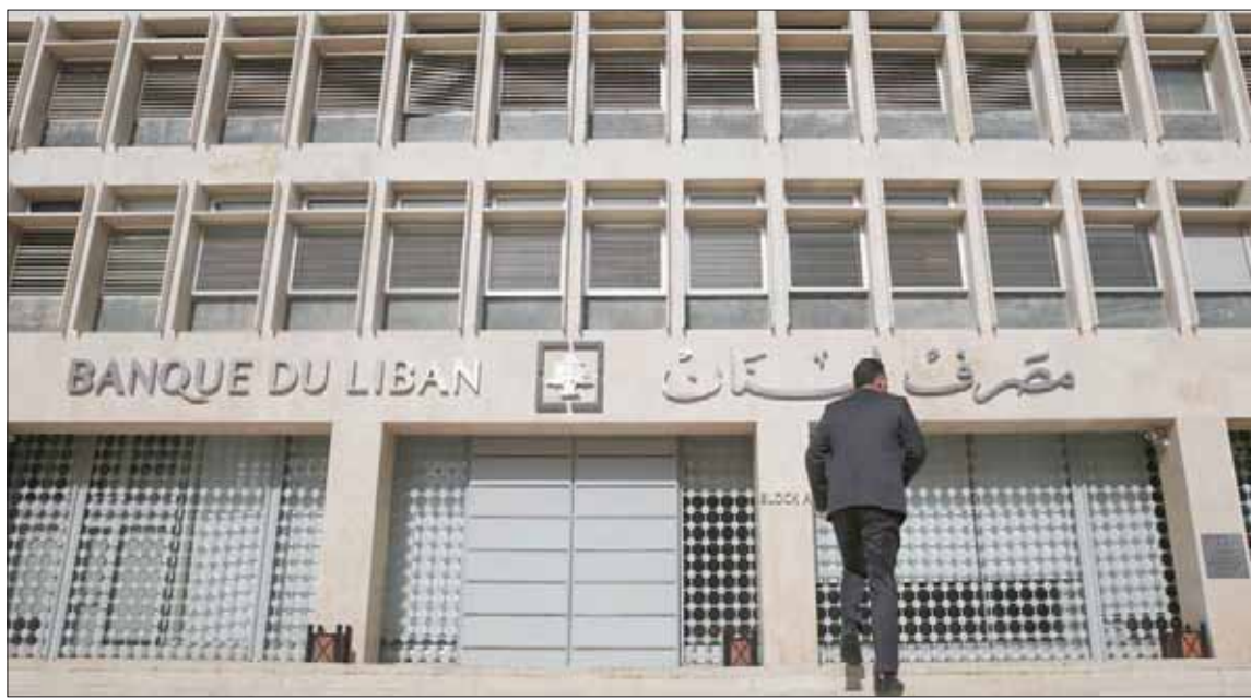
تسببت «تأويلات ملتبسة» لتصريحات الرئيس اللبناني ميشال عون في إربك الأسواق أمس

الديون وكلام عون، لا يخرج عن إطار الاتجاه، «مضيفاً في حديثه أن الرئيس لم يتكلم عن الموضوع. وعندما تحدث عن التضخميات كان يقصد اللبنانيين، وتحديدًا العسكريين المتقاعدين، ولم يتطرق إلى إعادة جدولة أو لجوء إلى الصندوق لا من قريب ولا من بعيد، هو فقط قصد اللبنانيين وبمعروض حديثه عن العسكريين».