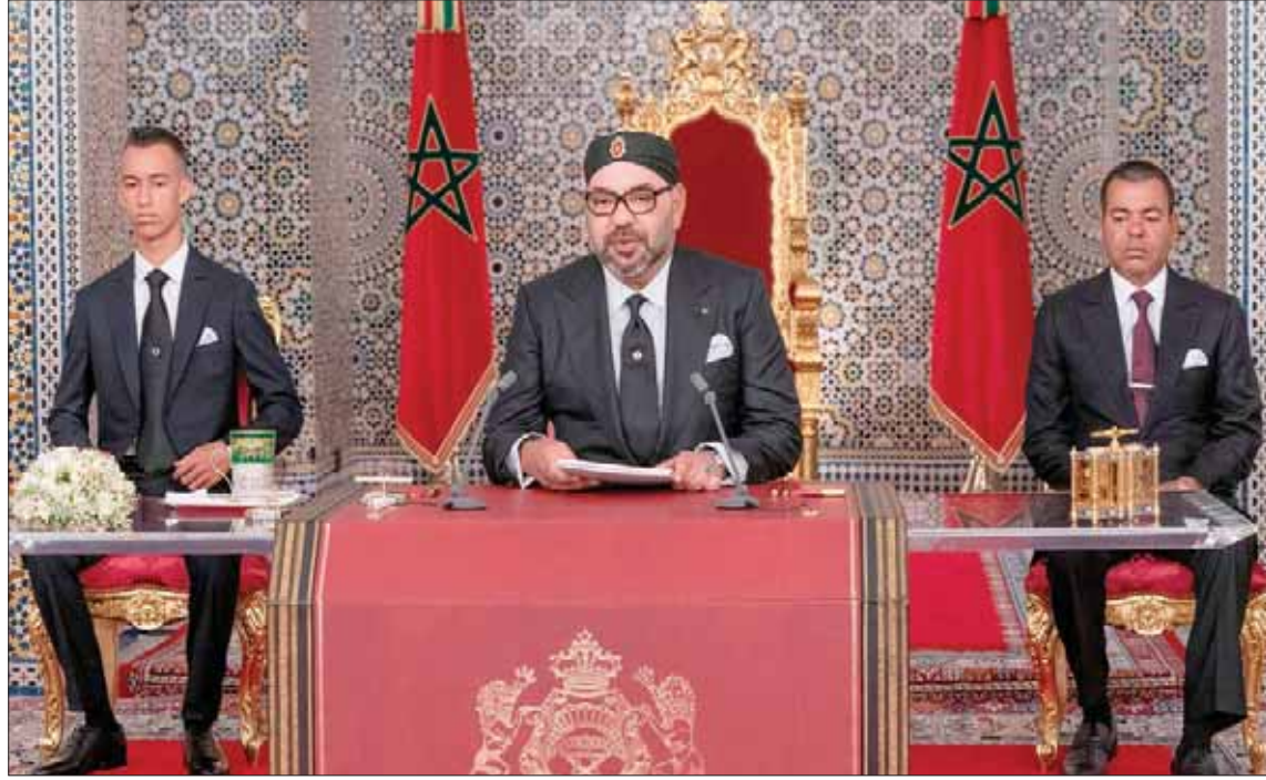
العاهل المغربي دعا في خطابه بمناسبة عيد الجلوس إلى إسناد مناصب المسؤولية في الإدارة إلى أصحاب الكفاءات (أ.ف.ب)

وأشارت وزارة الداخلية إلى أنها خطت خطوات كبيرة في مجال تطوير منظومة تدبير الموارد البشرية المرتبطة بهيئة رجال السلطة؛ حيث تم التأسيس بداية 2019 لتجربة فريدة من نوعها، تتعلق بتنزيل نظام جديد ومتكامل لتقييم نجاعة أداء رجل السلطة. كما جرى خلال الاجتماع تجديد دعوة كافة مصالح وزارة الداخلية إلى المشاركة على بذل الجهود، والتنزيل السليم لتوجيهات الملك، والحرص على الاهتمام بمصالح المواطنين والعدالة بشؤونهم، والنهوض بالمسؤوليات بكل ما تستلزم من صدق وإخلاص ونزاهة واستقامة ومثابرة.