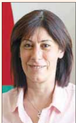
الأسيرة المحررة خالدة جرار