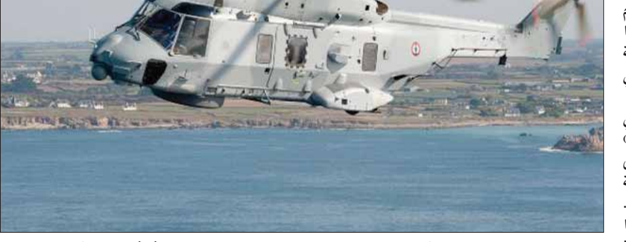
صورة نشرها موقع البحرية الألمانية وتظهر اختبار مروحية عسكرية من طراز أن أتش 90 الأسبوع الماضي

خفظت مطالبات للحكومة الألمانية بإرسال قوات للمشاركة في مهمة لحماية ناقلات النفط في مضيق هرمز، اهتمام وسائل الإعلام الألمانية أمس، وذلك في وقت قفزت فيه قضية أمن الملاحة في الخليج، الذي يمر عبره نحو خمس إمدادات النفط العالمية، إلى صدارة الأجندة العالمية منذ مايو (أيار) عندما اتهمت واشنطن طهران بالوقوف وراء تفجيرات الحقت أضراباً بست ناقلات على مدى عدة أسابيع. واتهمت واشنطن إيران بأنها المسؤولة عن الهجمات التي استهدفت ست ناقلات نفط في مايو ويونيو (حزيران)، لكن الأزمة تفاقمت عندما احتجزت قوات من «الحرس الثوري» الإيراني في يوليو (تموز) ناقلة ترغف علم بريطانيا في مضيق هرمز على ما يبدو على احتجاج بريطانيا ناقلة إيرانية بتهمته انتهاك العقوبات الأوروبية بنقلها النفط إلى سوريا.