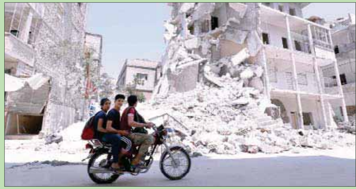
شبان على دراجة يمترون امام أبنية طالها الدمار في أريحا بإدلب أمس