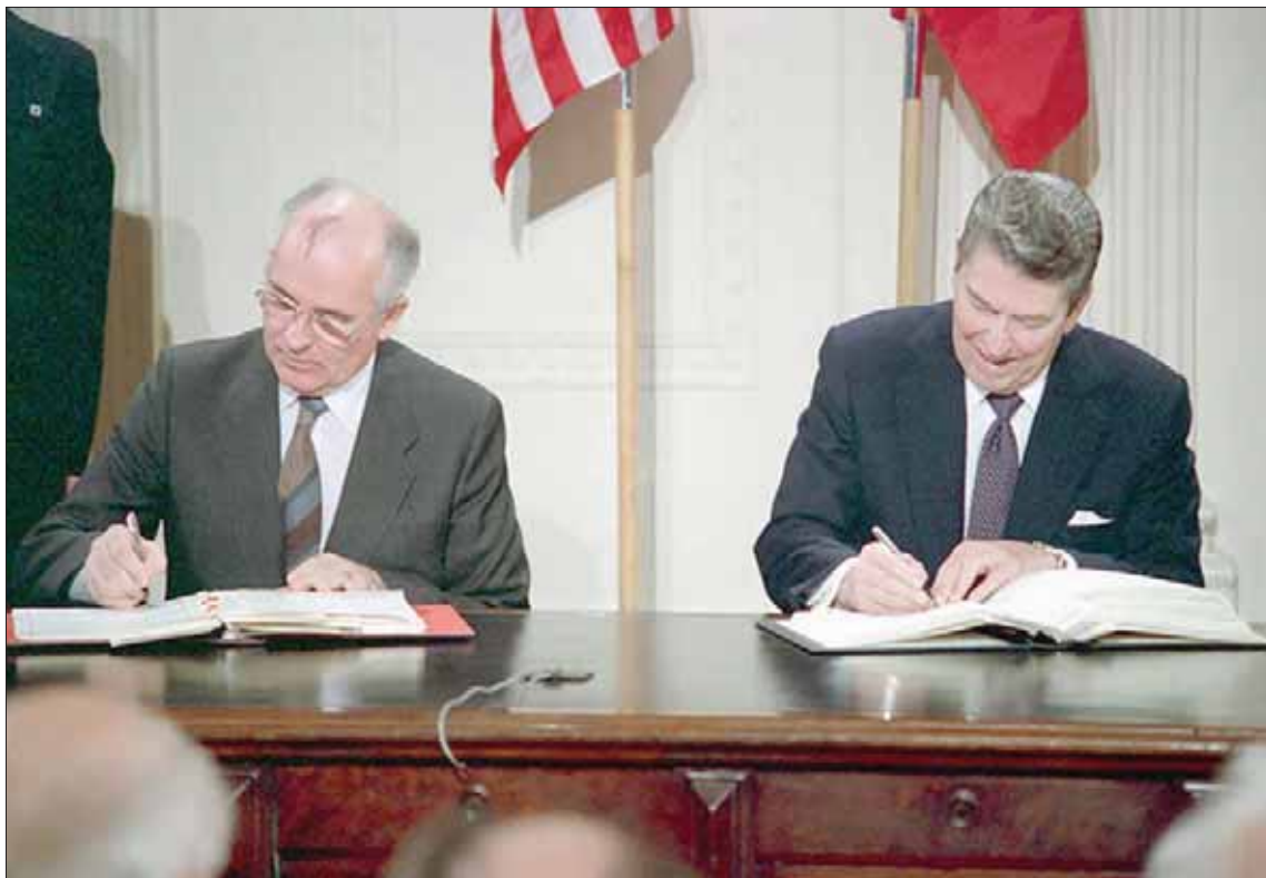
معاهدة «أي إن إف» وقعت في واشنطن من قبل الرئيس الأميركي رونالد ريغان والرئيس السوفياتي ميخائيل غورباتشوف عام 1987

واشنطن - موسكو، «الشرق الأوسط» تبادلت واشنطن وموسكو الاتهام بالمسؤولية عن انهيار معاهدة الأسلحة النووية المتوسطة المبرمة خلال الحرب الباردة بين الطرفين. ويهدد انتهاء المعاهدة بإطلاق سباق تسلح جديد بين الولايات المتحدة والاتحاد الروسي.