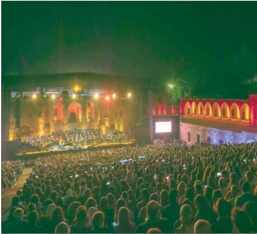
جمهور كاظم الساهر غنى ورقص معه وعلى الحانه