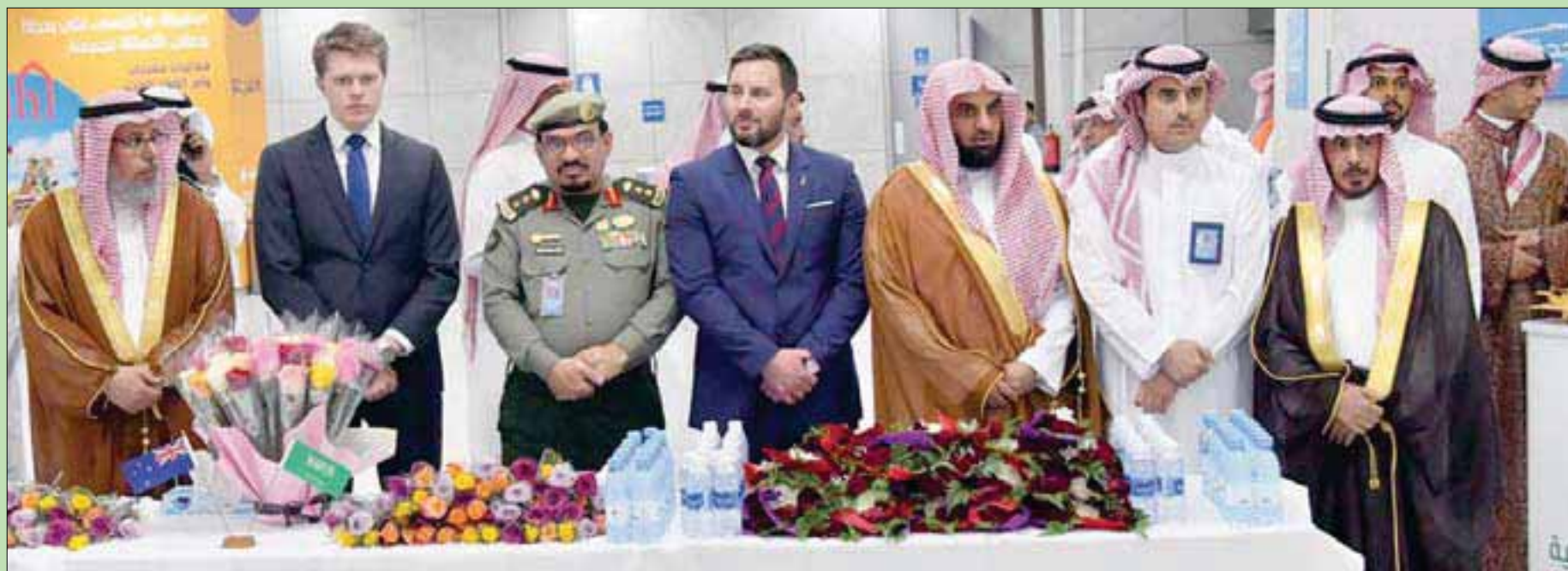
وكيل وزارة الشؤون الإسلامية وسفير نيوزيلندا لدى المملكة ومسؤولون من مختلف الأجهزة الحكومية في السعودية المعنية بخدمة الحجاج لدى استقبال ذوي مصابي وشهداء الحادث الإرهابي (واس)

وتكثرت جهات حكومية استقبلت أسد بالورود والطوى ضيوف الملك عبد العزيز وللحج والعمرة والزيارة من حجاج نيوزيلندا، تقدمهم وكيل اليوم من قبل الجهات الإسعافية وشرطة المنطقة التي يقطنها من جهته، قال عبد الرحمن إن معظم ذوي ضحايا مسجد النور