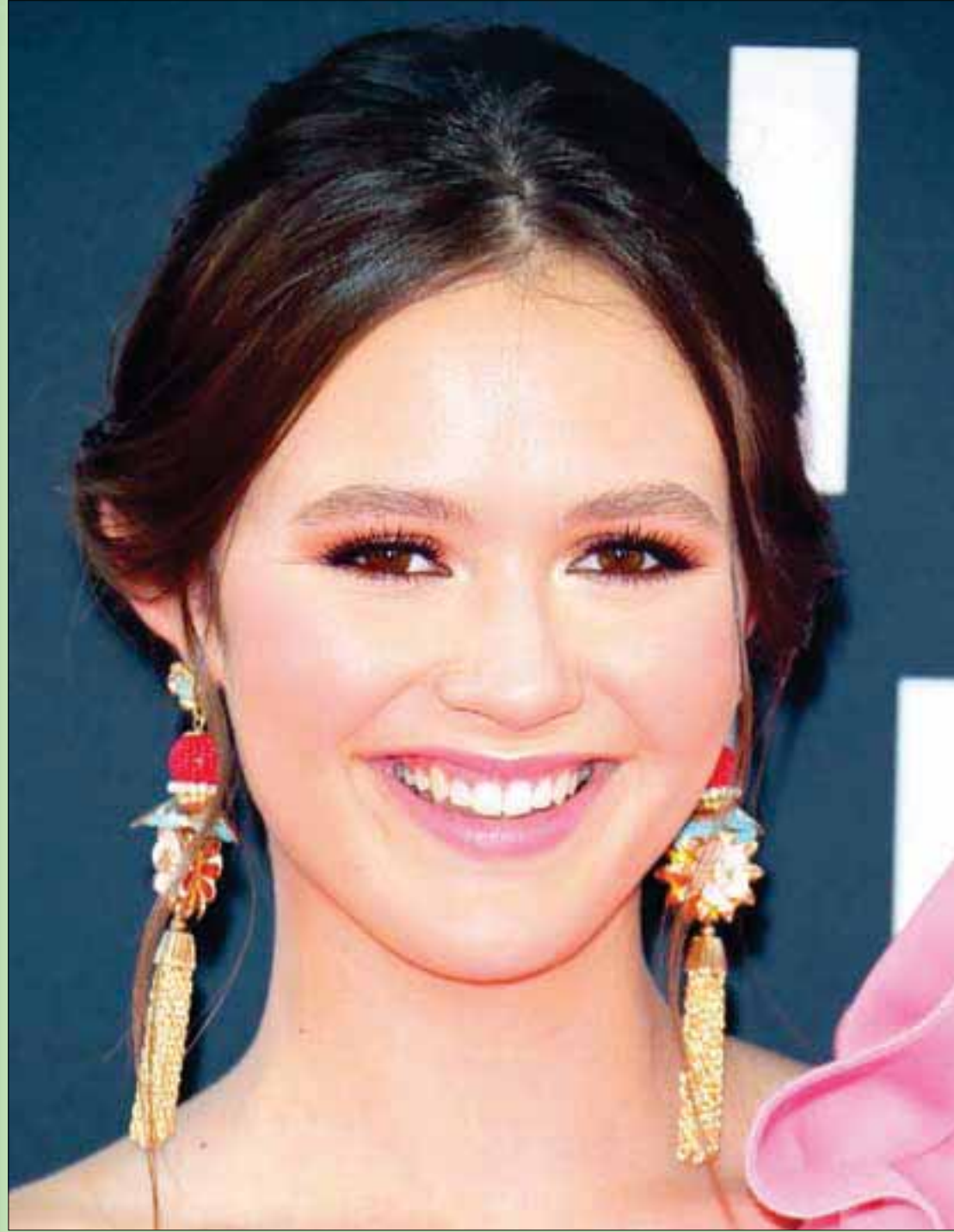
الممثلة الأميركية أوليفيا سانابيا حضرت العرض الأول لـ «سيري» في لوس أنجلوس

ليس ذلك أفضل من تسمية بعض الشوارع لكل من هب ودب، فعلى سبيل المثال، اسم الشارع الذي يقع عليه بيتي هو «أم الخير»، فمن تكون تلك الأم؟ وما خاتمتها من الإعراب؟