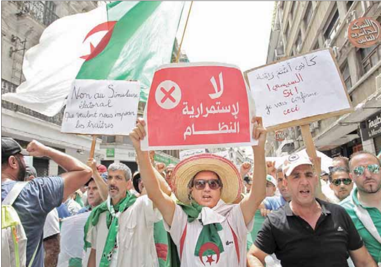
جانب من المظاهرات التي شهدتها العاصمة الجزائرية أمس رفضاً للحوار مع السلطة

وفي الشوارع والساحات المؤدية إلى وسط العاصمة، انتشر مئات الشرطيين بالزي أو