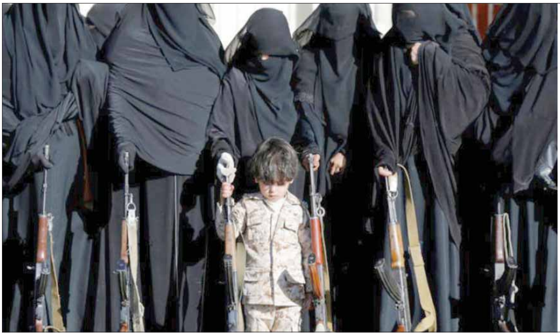
طلقة مع نساء، في تجمع مسلح بصنعاء

والقضاء عليها نهائياً. كما ناقش الاجتماع - وفق وكالة «سبا» الحكومية - تداعيات الأحداث التي طرأت مجدداً في مديرية المحفد شرق محافظة أبين والتي نشطت فيها العناصر الإرهابية لتنظيم «القاعدة»، وشنها هجمات على معسكرات ونقاط الحزام الأمني. وأكد الاجتماع «تفعيل غرفة عمليات مشتركة يتم من خلالها الاطلاع على مجمل تداعيات الأوضاع ووضع البات بالتعاون والعمل المشترك لما من شأنه التغلب على كل المشكلات وإحكام السيطرة الأمنية واستتباب الأمن والاستقرار»، وأقر «تشكيل لجنة تحقيق في حيثيات العمليتين الإرهابيتين في عدن ولجنة لحصر الأضرار البشرية والمادية في معسكر الجلاء وشرطة الشيخ عثمان وتقديم الدعم اللازم لآسر الشهداء والجرحى والتكفل بعلاجهم ومنحهم التعويض اللازم».