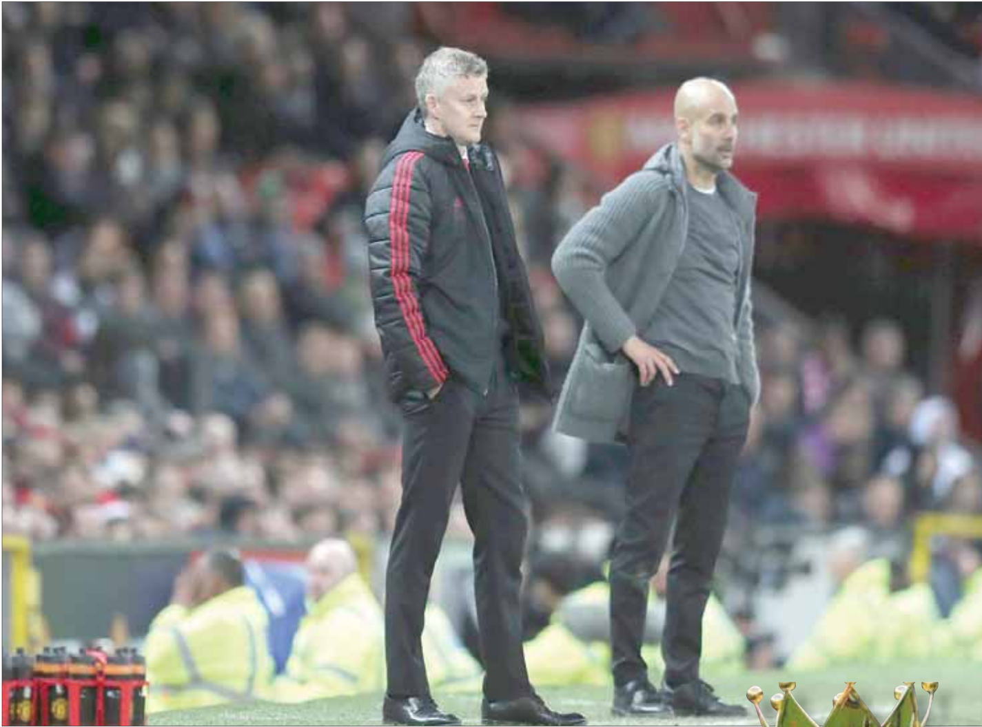
تعيين سولسكاير كان إيماءة بحلم يونايتد بالعودة إلى أمجاد الماضي في الوقت الذي علا فيه نجم غوارديولا

يتعين على النادي أن يدرك أن الحديث عن العراقة والتاريخ لم يعد يفيد في ظل تغيرات طرأت على اللعبة