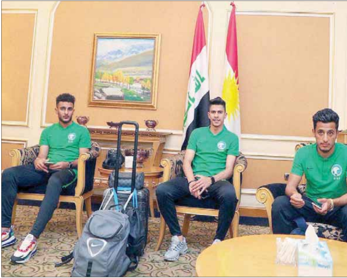
بعثة المنتخب السعودي لدى وصولها إلى أربيل أمس

في المجموعة الرابعة في كأس العالم 2022 وكأس آسيا 2023، التي تضم كلاً من منتخبات فلسطين، وسنغافورة، واليمن. ويتهائل أصحاب المراكز الثمانية الأولى في المجموعات وأفضل أربعة منتخبات تحتل المركز الثاني إلى بطولة كأس أمم آسيا 2023 المقرر إقامتها في الصين، وكذلك إلى المرحلة الثانية من التصفيات المؤهلة إلى كأس العالم 2022.