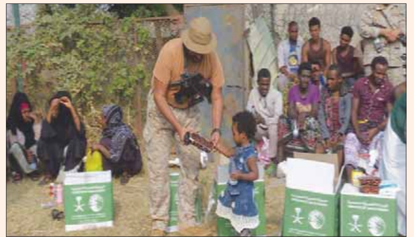
رافقت عملية تحرير الأفارقة حملة إغاثية عاجلة ونقلهم إلى مركز إيوا