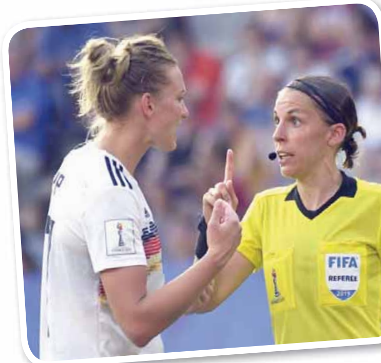
فراير (يمين) في كأس العالم الأخيرة للسيدات

المباراة النهائية للنسخة الأخيرة من مونديال السيدات في فرنسا، خطة من خمس نقاط لدعم توسيع كرة القدم النسائية. وكانت واحدة من تلك النقاط الخمس هي رفع عدد المنتخبات المشاركة في مونديال السيدات من 24 إلى 32. اعتباراً من 2023، على غرار ما تم القيام به في مونديال الرجال برفع العدد من 32 إلى 48 منتخباً، اعتباراً من 2026، وقال إنفانتينو وقتها: «لا يجب هدر الوقت. لا شيء مستحيل. إذا نظرنا للنجاح الذي حققه هذا المونديال (الحالي)، يجب أن نرى (نهائيات أكبر)». ويتنافس 9 مرشحين على استضافة كأس العالم 2023 هي: أستراليا، والبرازيل، والأرجنتين، وبوليفيا، وكولومبيا، واليابان، وجنوب أفريقيا، وكوريا، ومشارك مع كوريا الشمالية، ونيوزيلندا.