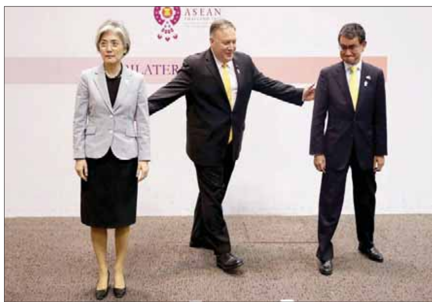
وزير الخارجية الأميركي مايك بومبيو يتوسط نظيره الكورية الجنوبية كانغ كونغ وها ونظيره الياباني تارو كوني خلال قمة دول رابطة «آسيان» في باتوكوك أمس

المدى. وذكرت هيئة الأركان المشتركة في سيول، أن الصواريخ قطعت مسافة 220 كيلومتراً وبلغت ارتفاع 25 كيلومتراً. وقالت الهيئة، كما نقلت عنها «رويترز»، إن بيونغ يانغ أطلقت مقذوفات