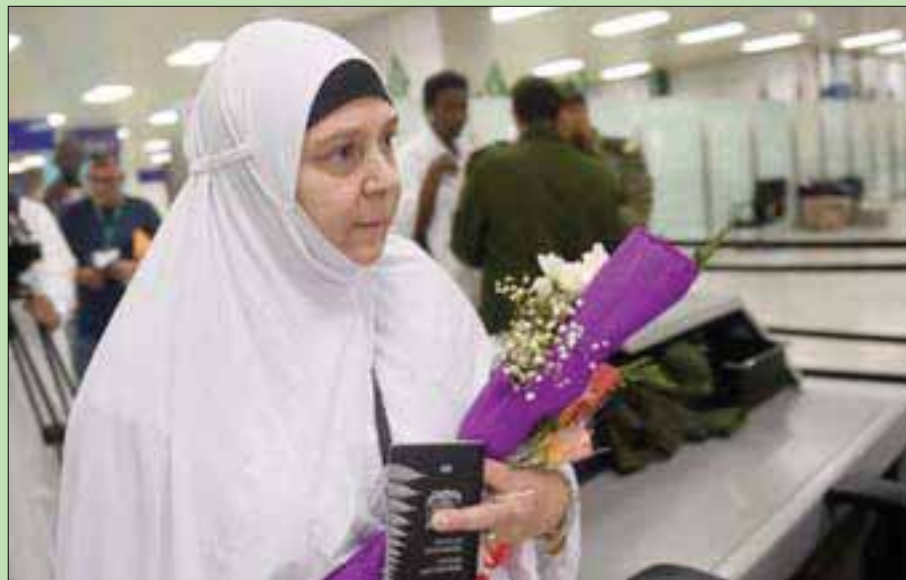
الحاجة النيوزيلندية تشرسي أثناء حديثها لـ«الشرق الأوسط» أمس