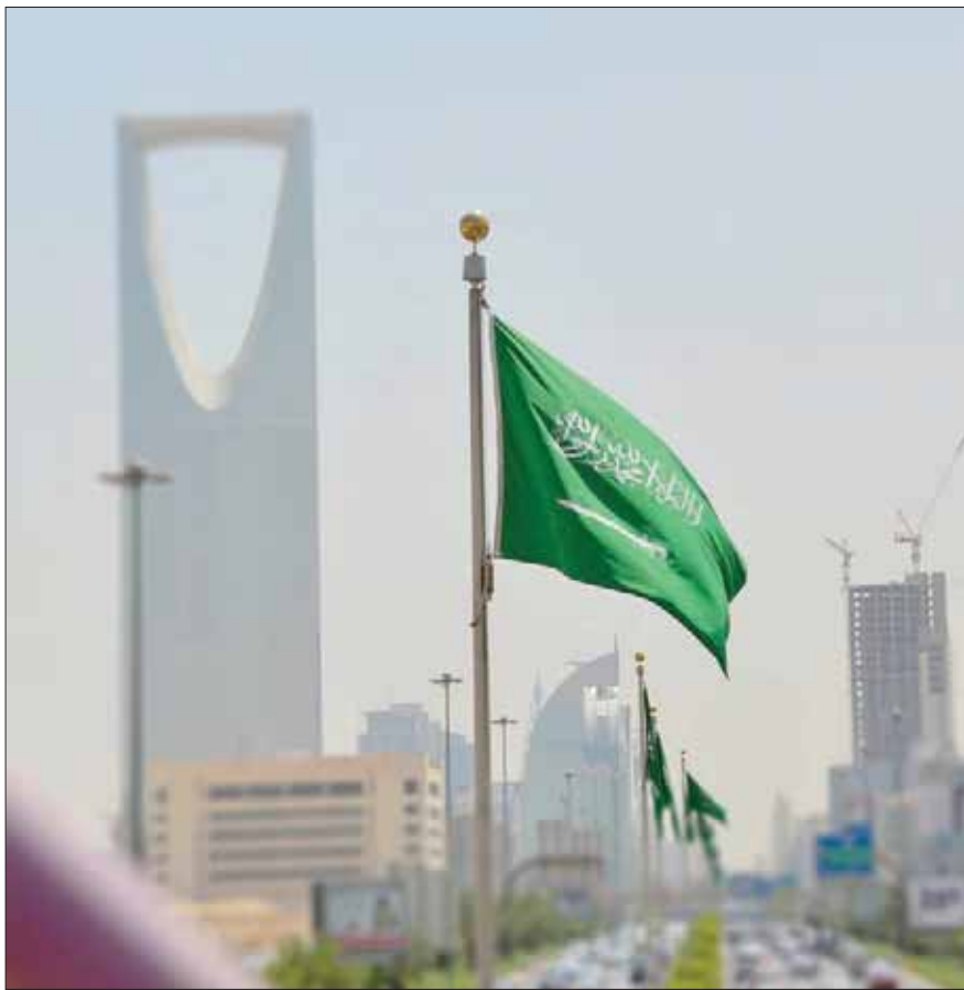
يسعى نظام المنافسات والمشتريات الحكومية لتعزيز النزاهة وتحقيق أفضل قيمة للمال العام

كما أشارت لائحة نظام المنافسات والمشتريات الحكومية إلى أن وزارة المالية ستعد لائحة لتطبيق وتعريض المصالح بشأن تطبيق أحكام النظام واللائحة، وللائحة لتنظيم سلوكيات وأخلاقيات القائمين على تطبيق أحكام النظام واللائحة، وتفضيل المحتوى المحلي والمنشآت الصغيرة والمتوسطة المحلية والشركات المدرجة في السوق المالية في الأعمال والمشتريات، وذلك بالاشتراك مع الهيئة والهيئة العامة للمنشآت الصغيرة والمتوسطة وهيئة السوق المالية، على أن تشمل الآليات تفضيل المحتوى المحلي وكيفية احتسابه وتطبيقه في الأعمال والمشتريات بما في ذلك نسبة أفضلية في التقديم الفني والمالي للعروض أو نسبة إلزامية للمحتوى المحلي من القيمة الإجمالية للعقد، وكذلك آلية تفضيل المنشآت الصغيرة والمتوسطة المحلية والشركات المدرجة في السوق المالية في الأعمال والمشتريات بما في ذلك نسبة أفضلية في تقييم العروض أو نطاق سعر محدد أو نسبة مئوية من القيمة الإجمالية للعقد، وإعداد الغرامات المترتبة بسبب عدم التزام المتعاقدين بمتطلبات المحتوى المحلي.