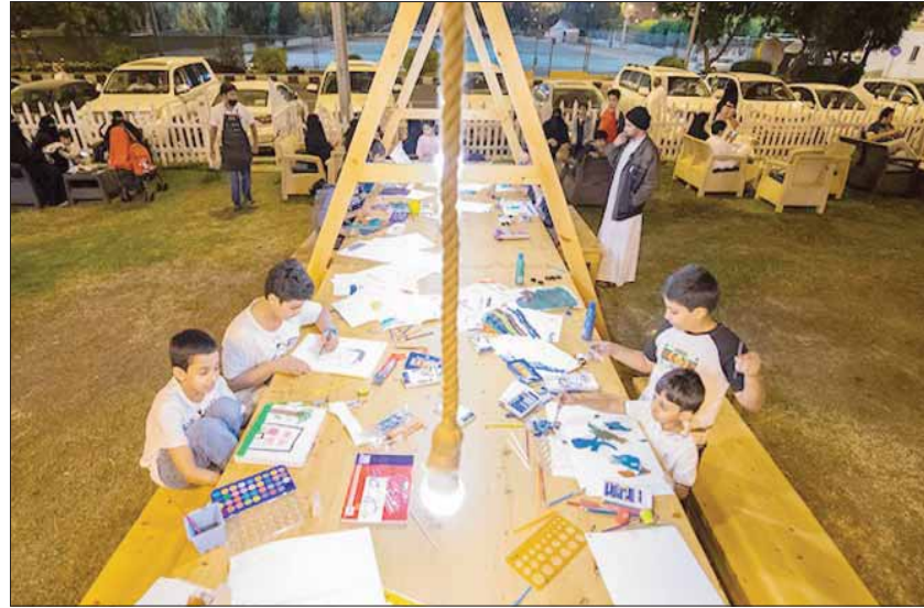
ورش عمل يومية للأطفال