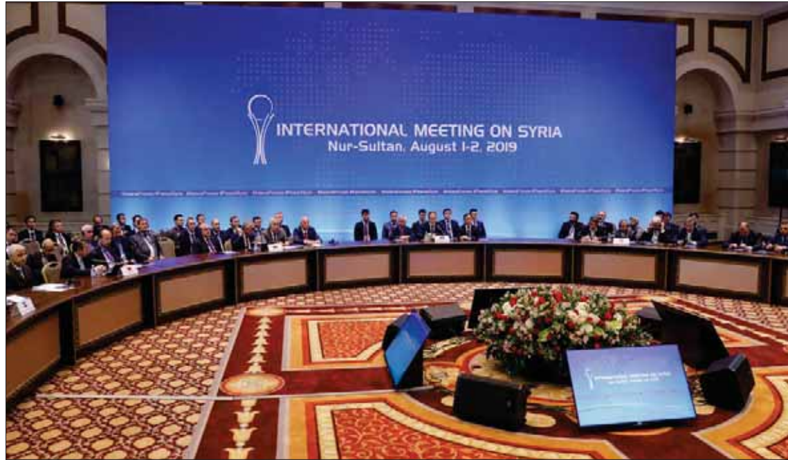
الجلسة الختامية لاجتماع أستانة في العاصمة الكازاخية أمس (رويترز)

والمانيا لا تزالان متمسكتين بمسار جنيف الدولي بموجب القرار 2254 وضرورة التزام ذلك لدى تشكيل اللجنة الدستورية وانعقادها. في المقابل، تضمنت تفاهمات «الضاميين» إشارات إضافية في رفض الواقع التي تجري شرق الفرات. ونص البيان على «رفض (الدول الثلاث) جميع المحاولات الرامية إلى خلق وقائع جديدة على الأرض بذيريعة مكافحة الإرهاب، بما في ذلك مبادرات الحكم الذاتي غير المشروعة. وأعربوا عن اعتزازهم بالتصدي للأجندات الانفصالية التي تهدف إلى تقويض أركان السيادة السورية وسلامة أراضيها فضلا عن تهديد الأمن القومي للبلدان المجاورة».