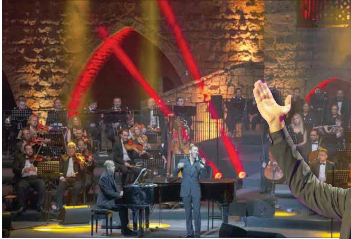
كاظم الساهر خلال حفله في مهرجان بيت الدين