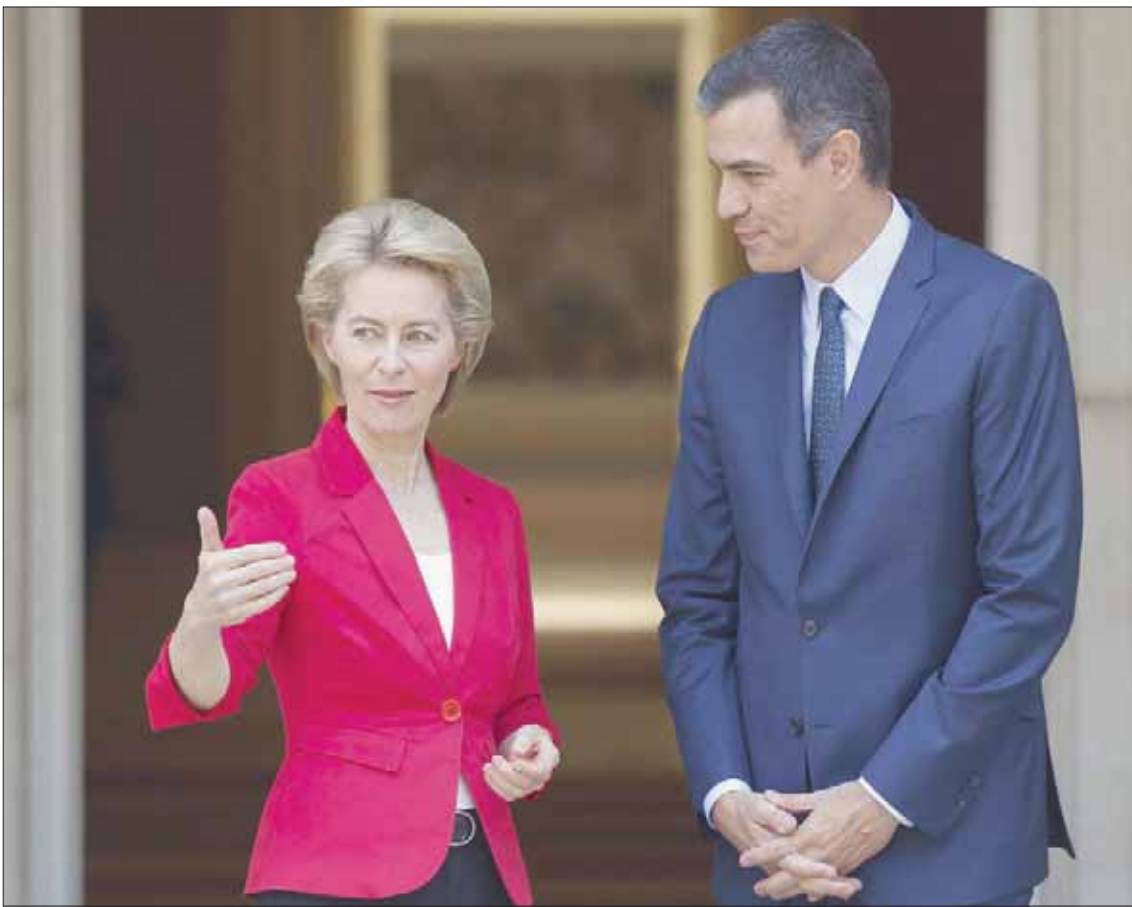
«الاشتراكي» بيدرو سانتشيز مع رئيسة المفوضية الأوروبية أورسولا فان دير لاين

وكان العامل الإسباني الملك فيليب السادس، الذي يحرص عادة على الوقوف على مسافة واحدة من جميع الأطراف السياسية، قد أعرب عن قلقه من الأزمة السياسية الناشئة عن تعنت تشكيل الحكومة بعد 3 أشهر من الانتخابات العامة. في غضون ذلك؛ طلب سانشيز من حزبه الإبقاء على الماكينة الانتخابية في جهوية تامة، بينما يواصل اتصالاته مع القوى البرلمانية لمحاولة التوصل إلى تشكيل أغلبية اللازمة. وقد تعزز موقعه التفاوضي في الساعات الأخيرة بعد نشر نتائج الاستطلاع الدوري الذي يجريه «مركز البحوث الاجتماعية»، وهو جهاز رسمي يرصد الاتجاهات الاجتماعية والسياسية في إسبانيا، التي أفادت بأن «الحزب الاشتراكي» قد يحصل على 41 في المائة من الأصوات في حال العودة إلى صناديق الاقتراع في الخريف المقبل، وذلك على حساب بقية الأحزاب والقوى السياسية. ويذكر أن «الحزب الاشتراكي» حصل على 28,3 في المائة بالانتخابات الأخيرة.