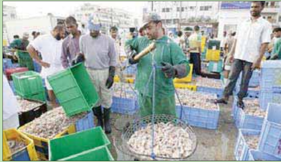
لقطة من موسم صيد الروبيان العام الماضي

المستخدمة مثل الشباك وسرعة تحركات السفن الكبيرة وهذه القوارب معتمدة عالمياً ويحظر تجاوزها. وعن مساحات الصيد في المنطقة الشرقية، بين الصفواني أنها تمتد من شرق جزيرة تاروت مروراً بالدمام وصولاً إلى مدينة الخبر، وهناك أيضاً مناطق صيد أخرى مثل منبجة وغيرها من المواقع التي تحددها الجهات المختصة. وأشار إلى المواقع تختلف من حيث العمق والمناطق القريبة من الشواطئ وما تحويه من مناطق طينية وكذلك شعب مرجانية وغيرها من العوامل الجغرافية التي ترفع وتخفض كمية وجود الكائنات البحرية.