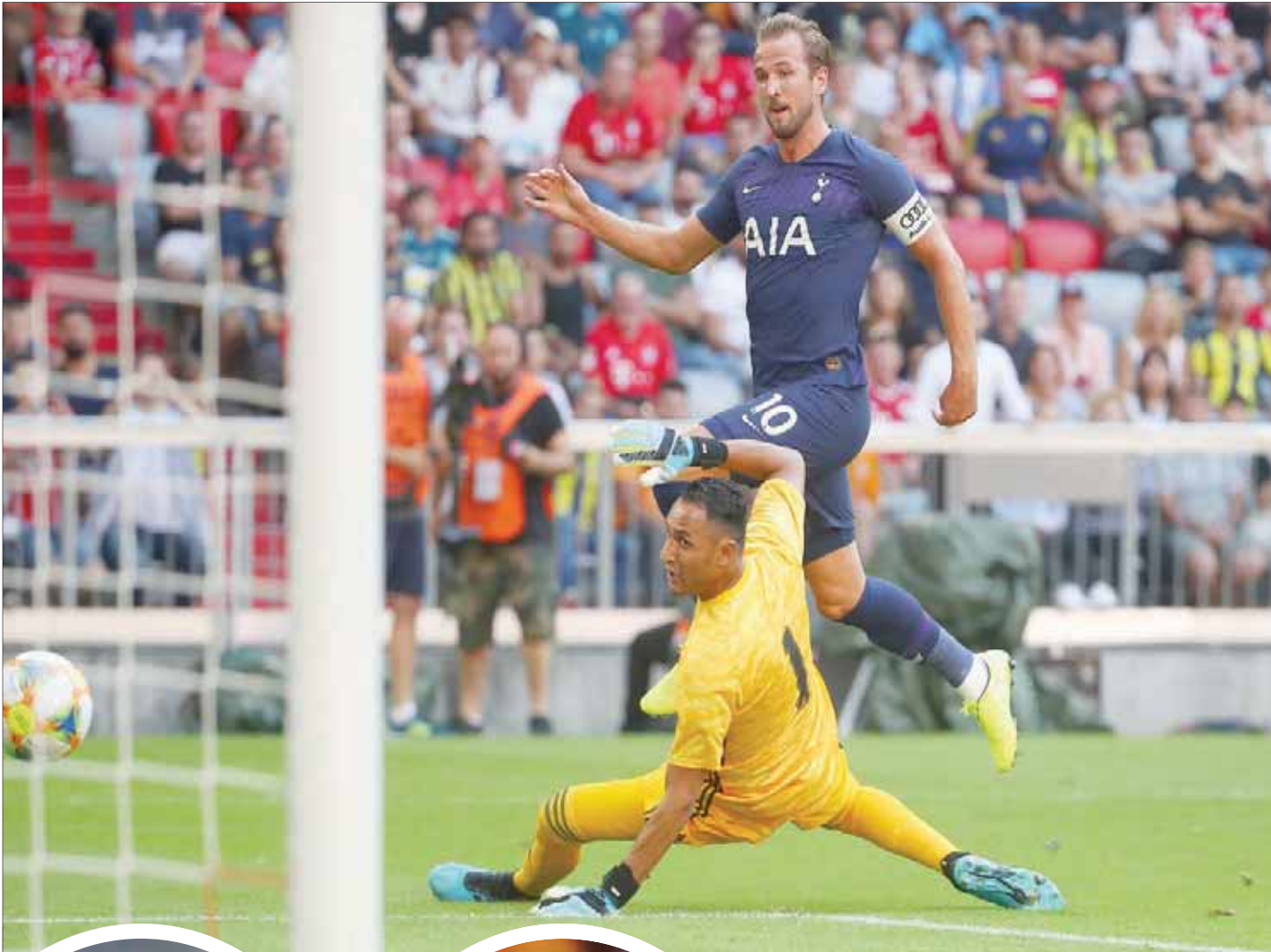
هاري كين يسجل هدف فوز توتنهام على ريال مدريد

10 أهداف فقط في 42 مباراة. في المقابل، انضم لوكاكو إلى صفوف يونايتد قادماً من إيفرتون في صيف 2017. في صفقة قدرت قيمتها بـ 75 مليون جنيه إسترليني، وشكلت حينها رقماً قياسياً لانتقال لاعب بين ناديين إنجليزين. وكشف المدرب النرويجي مانشستر يونايتد أولي غونار سولسكاير أن النادي يعمل على إجراء تعاقد أو اثنين إضافيين قبل بدء الموسم، وبعد ديبالا يوجه يونايتد جهوده لضم قلب دفاع ليستر سيتي الدولي الإنجليزي هاري ماغواير. وأصبح التعاقد مع ماغواير ضرورة ملحة ليونايتد بعد إصابة مدافعه العاجي إريك بايلي الذي خضع لعملية جراحية في ركبته ستعده عن الملاعب لنهاية العام الحالي. وتعرض بايلي، 25 عاماً، للإصابة في المباراة التي فاز بها فريقه على توتنهام ودياً في الصين يوم 25 يوليو الجاري. وقال سولسكاير بعد الفوز على كريستيانسون 1 - 0 في الترويج مساء أول من أمس ودياً: «نأمل أن يعود في فترة أعيد الميلاد قبل نهاية العام، لقد خضع لعملية وسيكون على ما يرام».