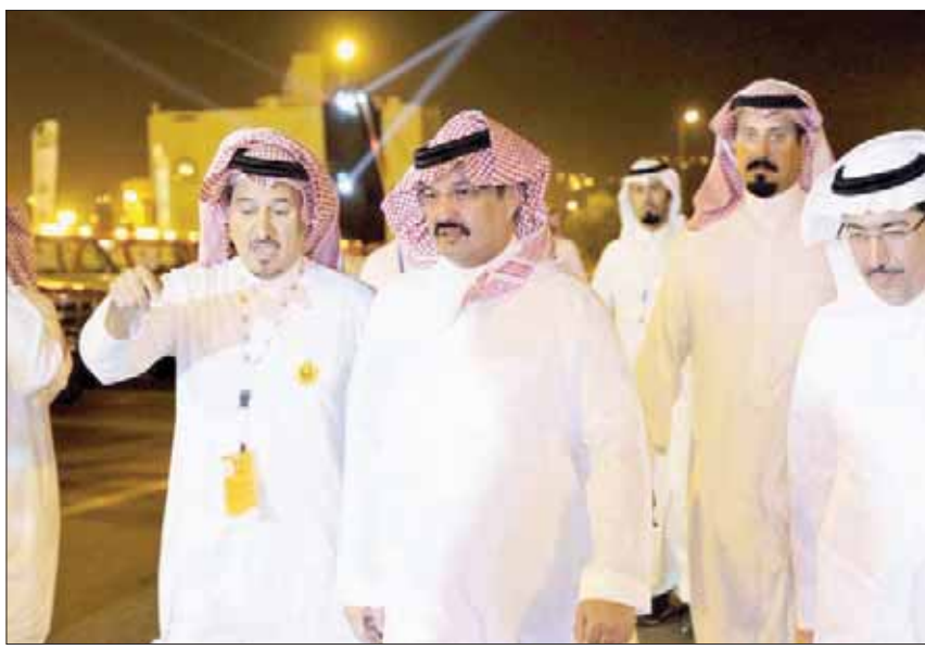
الأمير تركي بن طلال لدى تفقده استعدادات اللجان المنظمة للسباق

وفيما يخص الصعوبات التي واجهتها، قالت: من الصعوبات التي واجهتها في البدايات هو عدم القناعة بقيادة المرأة لسيارة السباقات، وكذلك عدم وجود معلومات كافية في الميكانيكا، وكنت أتعرض للكثير من التهريج، من بعض المنافسين لي عندما أنطق أي شيء يخص الميكانيكا بشكل خاطئ، ولكن لم