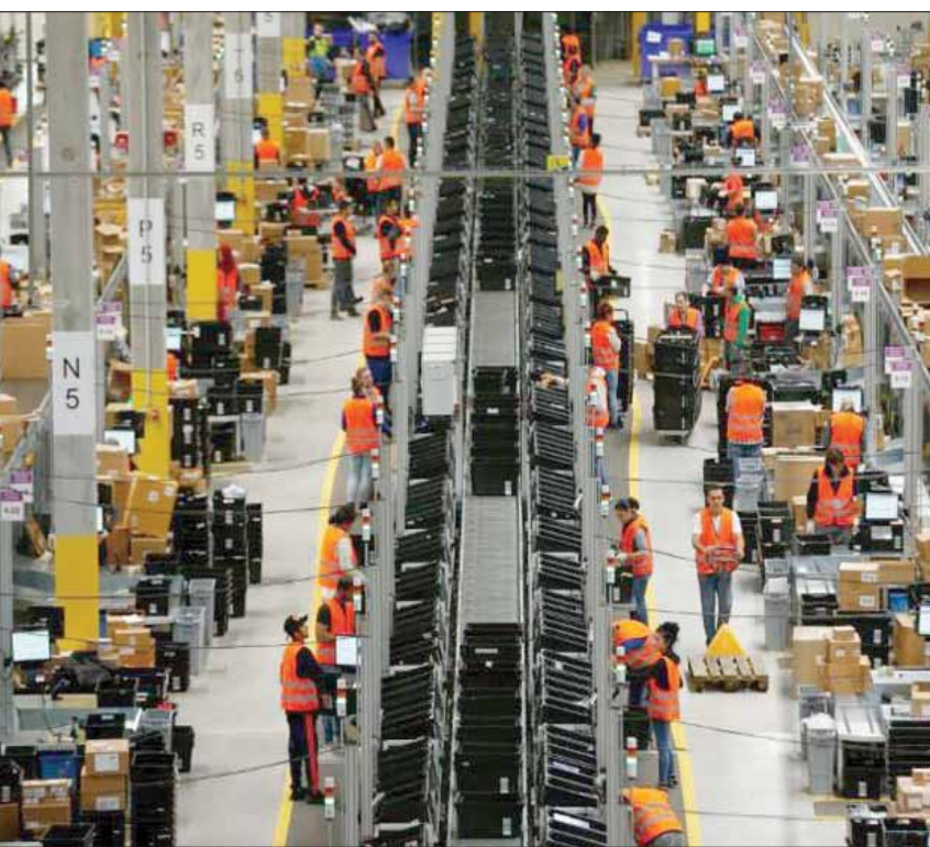
عدد العاطلين عن العمل في ألمانيا ارتفع في يوليو إلى 2,275 مليون شخص

وقال بيانات معهد الاقتصاد الألماني، فإنه تم الانتهاء عام 2018 من تجهيز 287 ألف شقة على مستوى ألمانيا، لكن لا يزال هناك في المدن الكبيرة نقص هائل في المساكن، في حين أن هناك بيوتاً غير مهيولة وفائضاً في المعروض، في المدن الصغيرة وفي المناطق الريفية. وأشار الاتحاد الألماني للمساكن المستقرة في تأجير، مؤخرًا، إلى أنه لا يمكن توفير سوى نصف المساكن ذات الإيجار المنخفض، وعدد أقل من المساكن الاجتماعية.