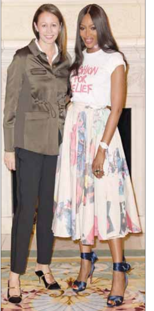
ناعومي كامبل مع كارولين راش الرئيس التنفيذي لمجلس الموضة البريطاني

الشهر الرابع. لم تقابلها العارضة في حياتها قط؛ لذا فهي لا تحمل اسم والدها الحقيقي وإنما اسم زوج أمها الذي عاشت في رعايته. قضت الطفلة السنوات الثلاث الأولى من حياتها في روما قبل أن تعود بها أمها إلى لندن لتودعها عند أحد الأقارب بسبب انشغالها بصفتها راقصة محترفة تجوب أوروبا مع فرقتها. في سن العاشرة بدأت ناعومي خطواتها الأولى في عالم البالية وفي سن الثانية عشرة ظهرت في فيديو غنائي يحمل اسم Is this Love للمطرب بوب مارلي ثم اكتشفتها إحدى الوكالات اللندنية المتخصصة بتقديم العارضات، وقبل أن تحتفل بعيد ميلادها السادس عشر كانت قد ظهرت على غلاف مجلة Elle البريطانية وبسرعة حققت قفزات كبيرة في عالم الموضة، حيث كانت أول عارضة سوداء تحتل غلاف مجلة فوغ بنسختها الفرنسية في عام 1988. دعمها المصمم إيف سان لوران بقوة، بعد أن اشتكت له من رفضهم لنشر صورتها على غلاف المجلة بسبب لون بشرتها. ثم ظهرت صورتها على غلاف مجلة فوغ الأميركية في عام 1989 ومجلة فوغ الروسية وأخيراً فوغ البريطانية. ومنذ ذلك الوقت احتلت صورها أغلفة أكثر من 500 مجلة حول العالم وعملت مع أشهر العلامات التجارية.