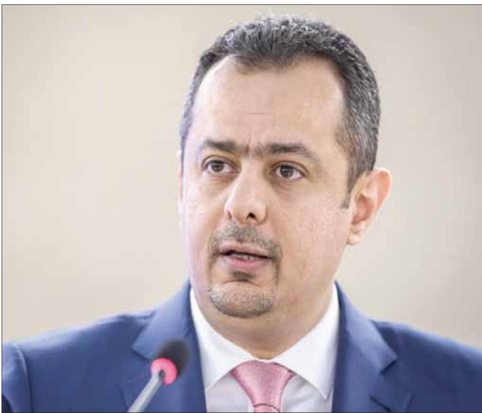
رئيس الوزراء اليمني معين عبد الملك

-الدولة اليمنية تعطي اهتماماً خاصاً ملف السلام وتعمل على الوصول إلى سلام دائم؛ ولذا فإن ملف التفاوض السياسي يدار بإشراف مباشر من فخامة الرئيس ونخبة الوزراء، ولدينا فريق مفاوض يؤدي مهامه باقتدار وتميز، والرؤية التي ينطلق منها هي الرؤية الموحدة للقيادة السياسية لليمن. ● يقول المبعوث الأممي إلى اليمن مارتن غريفيث إن هناك حلاً وشيكاً للآزمة خلال نهاية العام، هل تشاركونه الرأي؟ - العائق أمام الوصول إلى سلام دائم في اليمن يرتبط