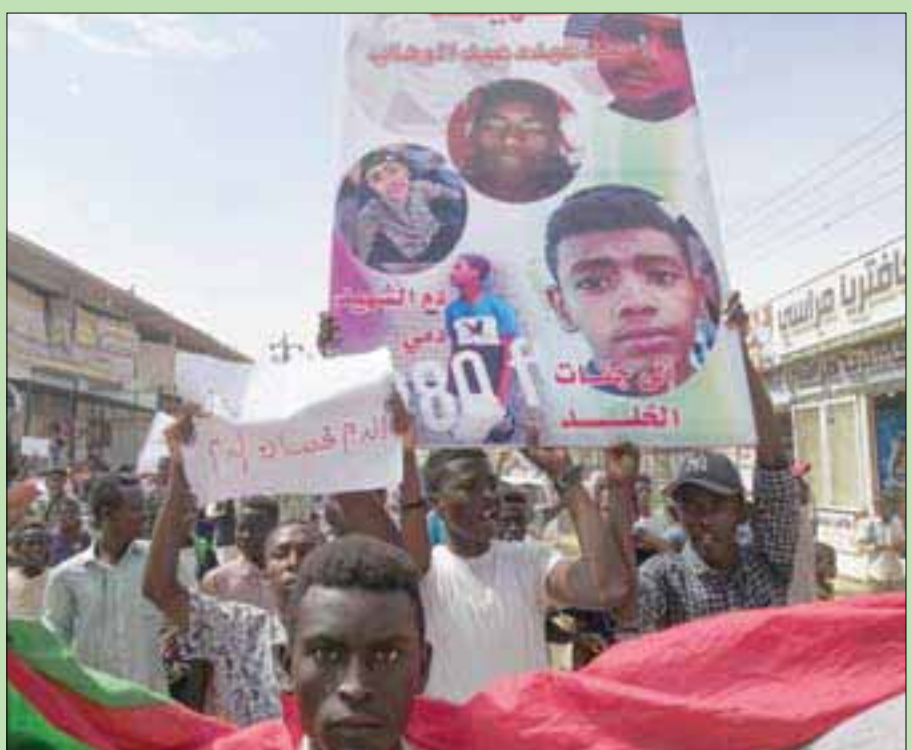
جانب من الاحتجاجات التي شهدتها شوارع الأبيض أمس

المحكمة ستكون علنية ويُسمح للجميع بحضورها، وربما تُبث على وسائل الإعلام. ويواجه البشير اتهامات فساد مالي وغسل أموال والتعامل بالنقد الأجنبي، وتحرير مبالغ ضخمة من العملات الأجنبية في مكان سكنه الرئاسي، إضافة إلى تهمة النراء الحرام والمشبوه. ويرى معارضون أن الجرائم الموجهة إلى البشير في القضية المعروضة أمام المحكمة هي «أهون» الاتهامات التي ارتكبتها البشير إبان حكمه لسودان بالحدود والنار طوال 30 سنة. ويواجه البشير تهماً أخرى، تتضمن التحريض على قتل المتظاهرين، وتدمير انقلاب عسكري ضد حكومة مدنية منتخبة، وتقويض الدستور، وارتكاب جرائم إبادة جماعية وجرائم حرب وجرائم ضد الإنسانية. وقد أطيح بالبشير من الحكم في 11 أبريل (نيسان) الماضي بثورة شعبية، وانتقلت إليه «الجنة الأمنية» التي كوّنها لقمع المحتجين، وأنهت حكمه وأودعته السجن منذ ذلك الوقت.