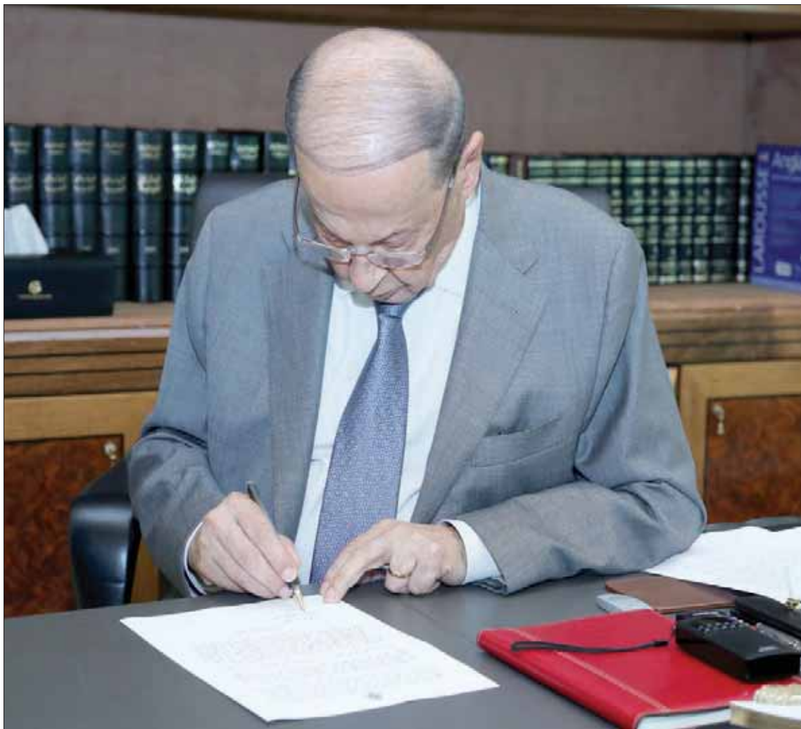
الرئيس ميشال عون يوقع قانون الموازنة (الاتي ونهرا)

نفسه عن سبب طرح هذه القضية في الوقت الحالي بعد نحو 30 سنة من اتفاق الطوائف الذي أضيف إليه هذه المادة. هذا السؤال يردّ عليه النائب عون قائلاً: «في السنوات الماضية سجل خلل في غياب المسيحيين الفعلي عن الدولة وهو ما انعكس على تمثيلهم في الإدارة، واليوم لا بد من تصحيح الوضع خصوصاً بعدما ظهر هذا الخلل بشكل نافر في عدد من المماريات الأخيرة التي أجريت وأسهم في وضع هذه القضية على الطاولة لبحثها». مع تأكيد ضرورة أن يترافق معيار الكفاءة ضمن الوظائف مقترحاً تحديد كوتا معينة لكل منها وعدم قبول الراسيين حتى لو لم يتم تأمين هذه الكوتا.