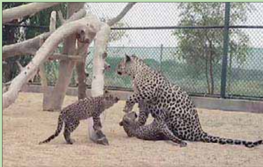
صغيرا النمر العربي يلهوان مع أمهما في المحمية التابعة للهيئة الملكية لحفظ الغلا

سعود الفيصل لأبحاث الحياة الفطرية في الطائف بالتوازي مع وضع الخطط الاستراتيجية وتصميم مركز عالمي حديث للأبحاث والتقنية ورعاية وتربية النمر العربي في محافظة الغلا. فضلاً عن تعزيز عمليات التشغيل والتأهيل وتنشيط المواثل في محمية شرعان الطبيعية بالغلا.