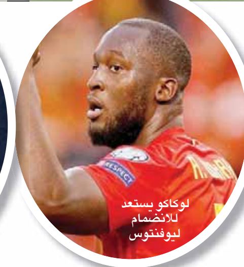
لوكاكو يستعد ليوفنتوس

لا سيما بعد انتقال النجم البرتغالي كريستيانو رونالدو قادماً من ريال مدريد الإسباني. وكان ديبالا أعلن عن رغبته في البقاء ضمن صفوف يوفنتوس، لكن يبدو أنه لا يدخل ضمن مخططات المدرب الجديد ماوريتسيو ساري. ويدافع ديبالا عن السوانز يوفنتوس منذ صيف عام 2015 حين انضم إلى صفوفه قادماً من باليرمو. وهو قدم أداءً متفوقاً في الموسم الأخير، إذ أنهى الموسم 2017 - 2018 مع 26 هدفاً في 46 مباراة في مختلف المسابقات، وموسم 2018 - 2019 الذي شهد انضمام رونالدو، مع