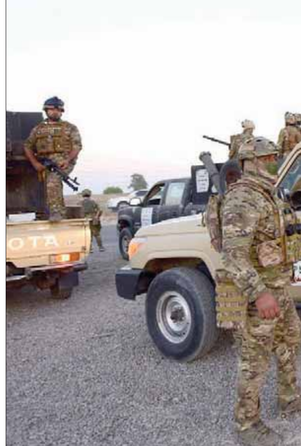
مسلحون من «الحشد الشعبي» في العراق

في سياق ذلك، رحبت كتلة الحزب الديمقراطي الكردستاني في البرلمان