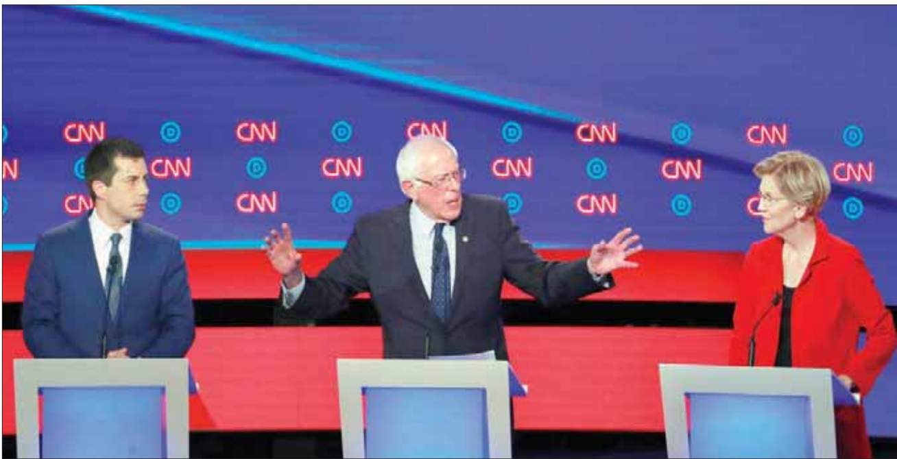
جانب من المناظرة الديمقراطية في ديترت أمس

وتربق الديمقراطيون أمس أداء جو بايدن (76 عاماً) والسيناتورة كامالا هاريس التي تحتل المرتبة الرابعة في استطلاعات الرأي، حيث تلقى تأييد 10,5 في المائة من الناخبين الديمقراطيين والتي تسعى لتعزيز شعبيتها. ففي المناظرة الأولى التي جرت قبل شهر، هاجمت السيناتورة بايدن على مواقف تبناها في الماضي من التمييز العنصري. وقد فوجئ ودافع عن نفسه من دون حماس، بينما كسبت هاريس بعض الشعبية. أما السيناتور كوري بوكس (1,5 في المائة) فقد هاجم بايدن لدمعه قانوناً قمعياً صدر في 1994. وأكد مؤخرًا أنه يمكن أن يعود إلى هذه القضية. وأكد بايدن أنه مستعد لأن يكون «أقل تهديداً»، وقال: «إننا أريدوا الحديث عن الماضي، فيمكنني القيام بذلك». وأضاف: «لكن لدي ماضٍ أفتخر فيه وماضيهم ليس جيداً بنفس الدرجة».