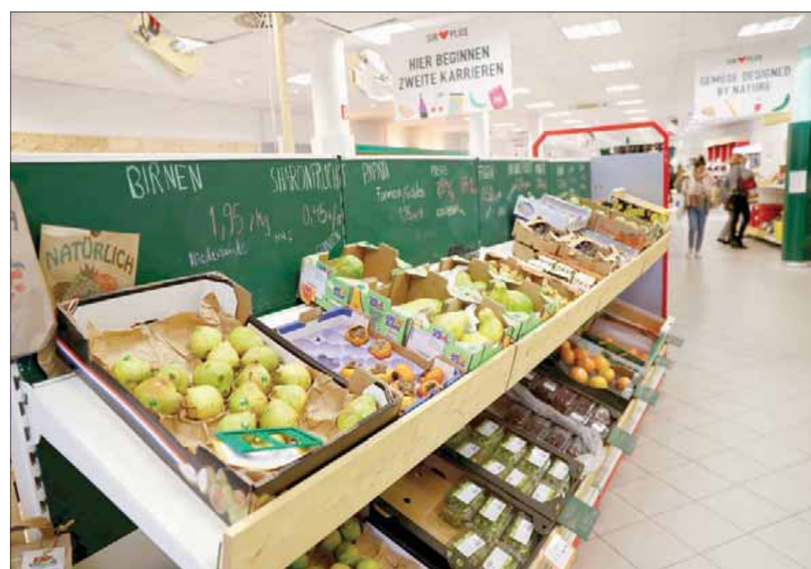
انعكس تباطؤ النمو في تراجع نمو أسعار المستهلكين

وقال مكتب الإحصاء الأوروبي (يوروستات)، إن معدل البطالة المعدل موسمياً في منطقة اليورو، تراجع إلى 7,5% في يونيو الماضي، بنسبة هبوط 0,1% مقارنة بشهر مايو (أيار) الماضي. ويعد هذا هو المعدل الأقل، الذي يجري تسجيله في منطقة العملة الموحدة منذ يوليو 2008، وكان الرقم المسجل في يونيو من العام الماضي قد بلغ 8,2%. وكانت مكتب الإحصاء