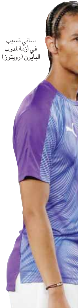
ساني تسبب في أزمة لمدرّب الباييرن (رويترز)

ويشكل هذا منعطفاً جديداً في العلاقة المتذبذبة بين كوفاتش ورومينيغيه، وعززت التقارير الإعلامية بأن الرئيس التنفيذي لا يبدي إعجاباً بطريقة المدرب الكرواتي من أن عين في المنصب قبل بداية الموسم الماضي. وكان رومينغيه حذراً في إعلان القرار بشأن استمرار كوفاتش في تدريب الفريق بعد تعاقد مع ساني، الذي قد تكلف صفقة ضمه نحو 50 مليون يورو (56 مليون دولار)؛ حيث أبدى الإسباني جوسيب غوارديولا المدير الفني لمانشستر سيتي رغبته في عدم بيع اللاعب على جانب آخر. وتوقع معظم مدربي أندية الدوري الألماني أن يستمر بايرن ميونخ مهيمناً على لقب البطولة في الموسم الجديد. وكشف استطلاع للرأي أجرته وكالة الأنباء الألمانية أن 15 من مدربي الأندية المشاركة في الدوري الألماني (بوندرسليغا) يتوقعون فوز بايرن باللقب للمرة الثامنة على التوالي.