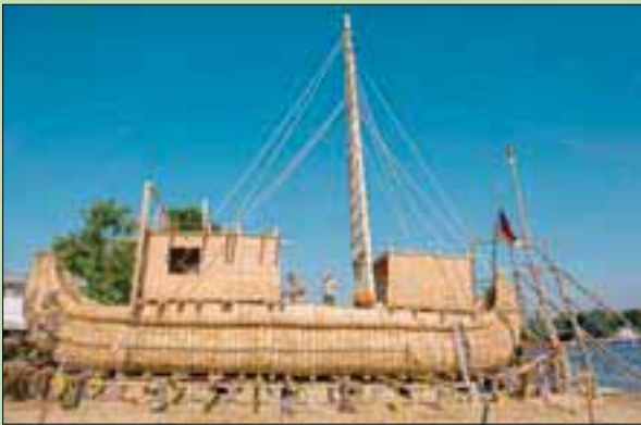
أعضاء من الطاقم يجمعون القارب «أبورا» في بلدة بيلوسلاف البلغارية

الوصول إلى جزيرة سيكلاديس من جزيرة كريت سيكون ضرورياً لإثبات نظريته الأولى، حيث أثبت ازدهرت بين عام 2700 إلى 1200 قبل الميلاد، قد تماثلت النشاط التجاري مع مصر الفرعونية.