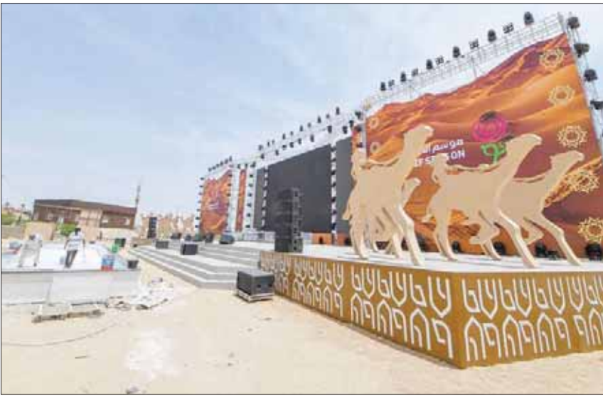
جانب من التجهيزات التي شهدتها الساحات الخارجية لفعاليات مهرجان ولي العهد للهجن (الشرق الأوسط)

ولي العهد سيشهد إقامة 439 شوطاً، تبدأ بالمرحلة التنشيطية لجميع الفئات العمرية بأشواط بلغ عددها 218 شوطاً، فيما ستكون أشواط الماراثون والإنتاج والحرابر والأشواط الدولية والسودانية بعدد 48 شوطاً، بينما ستكون الأشواط الختامية للمهرجان بعدد 173 شوطاً. وذكر العنزي أن المهرجان حقق في عامه الأول حضوراً لافتاً دخل على إثره موسوعة «غينيس» القياسية بعد أن شارك فيه أكثر من 11 ألف مطعة، بالإضافة إلى تنوع السباق وتقسيمه إلى عدة أقسام والتي ستكون من ضمنها الأشواط العربية والتي تخص الدول العربية فقط، وذلك لتعزيز هذا التراث.