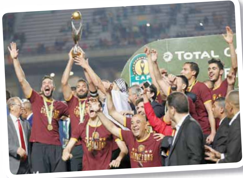
تتويج الترجي بلقب دوري الأبطال ما زال لم يحسم بعد

القضية إلى محكمة التحكيم الرياضي (كاس) أمس قرار الاتحاد الأفريقي لكرة القدم بإعادة مباراة الإياب من الدور النهائي لدوري أبطال أفريقيا بين الترجي التونسي والوداد البيضاوي المغربي. واعتبرت محكمة التحكيم الرياضي أن اللجنة التنفيذية للاتحاد القاري للعبة لم تكن «الجهة المختصة» لاتخاذ هذا القرار، مشيرة إلى أن بتصير النهائي يعود إلى «الأجهزة المختصة في الاتحاد الأفريقي»، الذي سينظر في الأحداث التي رافقت مباراة الإياب في الدور النهائي في 31 مايو (أيار) في تونس، واتخاذ القرار فيما يتعلق بإعادة المباراة من عدمها. وأكدت المحكمة أن مطالب النادي المغربي (إعلانه بطلا والحصول على المكافآت المالية) رفضت في حين سيتم النظر بمطالب الترجي في وقت لاحق. وكان الوداد والترجي تعادلا 1 - 1 في الدار البيضاء ذهاباً قبل أن يحسم الترجي مباراة الإياب 1 - 0 صفر عندما انسحب الوداد البيضاوي وترك أرض ملعب رواد بعد خلاف حول تقنية المساعدة بالفيديو (في إيه أن) التي لم تعمل. وتوقفت المباراة قرابة الدقيقة 60 إثر احتجاج الوداد على إلغاء هدف عادل به تقدم الترجي في الشوط الأول عبر الجزائري