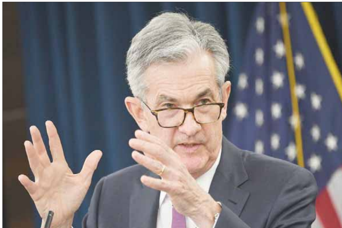
رئيس الاحتياطي الفيدرالي، جيروم باول (أغب)

الاقتصادي. لكن مؤشر الأسعار في يونيو (حزيران) وقبلها في مايو (أيار) يبقى بعيداً عن هذا الهدف، إذ إنه بلغ 1,4 في المائة. وكان من المتوقع أيضاً أن يصدر «الاحتياطي الفيدرالي» بعض المؤشرات حول الموقف الذي سيتخذه بعد ذلك، أي الانتظار أو التلويح بخفض جديد. وحتى الآن لم تشر تقديرات أعضاء اللجنة لمعدلات الفائدة، التي نشرت في يونيو، وإن يتم تحديثها قبل سبتمبر (أيلول) سوى إلى خفض طفيف حتى نهاية العام الجاري، بينما يواصل ترمب ممارسة أقصى حد من الضغوط على البنك المركزي لخفض تكلفة الدين. وقد صرح أمام الصحافيين في المكتب الأبيض الثلاثاء، بأنه يريد «خفضاً كبيراً» في معدلات الفائدة. وقال: «أشعر بخيبة أمل كبيرة من (الاحتياطي الفيدرالي) الذي كان يستعد لبدء اجتماعه النقدي. وأضاف أن الرئيس السابق باراك أوباما «كان لديه معدل فائدة يساوي الصفر». وبإحلال اللجنة النقدي، لم يكن من المؤكد أن ينجح جيروم باول في تحقيق إجماع على قرار خفض معدلات الفائدة الضخمة أساساً. وعبر اثنين من أعضاء اللجنة حتى الآن عن تحفظات. وقال إريك