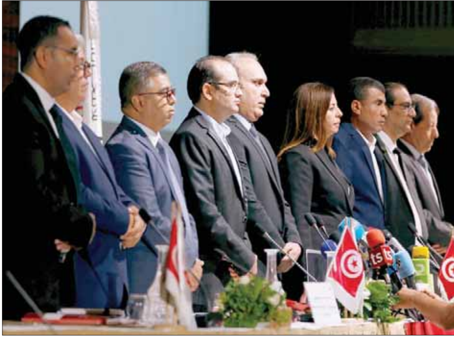
أعضاء البرلمان التونسي يقفون دقيقة صمت ترحماً على الرئيس الراحل الباجي قايد السبسي أمس

الناخبين، موزعين على 10 دوائر انتخابية على الأقل، أو جمع توقيع 40 رئيس بلدية. وتضم قائمة المرشحين أيضا عددا مهما من الأسماء المعروفة، من بينها مصطفى بن جعفر رئيس المجلس الوطني التأسيسي، وحامدي الجبالي القيادي السابق بحركة النهضة ورئيس الحكومة الأسبق، ونجيب الشاذلي رئيس حزب الحركة الديمقراطية، والهاشمي الحامدي رئيس حزب تيار المحبة. بالإضافة إلى قيس