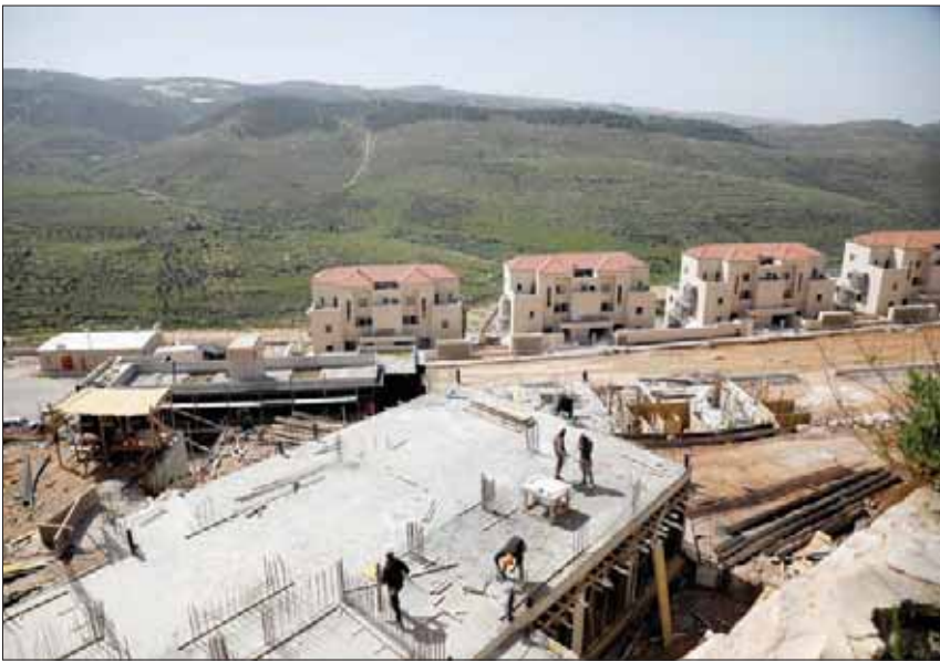
عمال في مواقع بناء مستوطنات إسرائيلية بالضفة الغربية في أبريل الماضي

الجدير ذكره أن حكومة إسرائيل اتخذت قراراً بطلب من كوشنر يقضي بالسماح للفلسطينيين ببناء مئآت من الوحدات السكنية في مناطق «C» التي تخضع للسيطرة الأمنية والمدنية الإسرائيلية. وقد «الكابيت»، المجلس الوزاري المصغر، فعلاً خطة كهذه، بعد ثلاث جلسات عاصفة، على مدار ثلاثة أيام. وحسب القرار، ستتاح إنشاء 700 وحدة سكنية للفلسطينيين في المنطقة «C». ولكن هذا القرار لم يمر في «الكابيت»، إلا بعد أن وافق نتنياهو على تضييقه شرطاً، بأن تكون إسرائيل هي وحدها المسؤولة عن البناء في المنطقة «C»، مع العلم بأن اتفاقيات أوسلو تتيح للسياسة الإسرائيلية، في هذا الشأن، أن تفرض شروطاً على الفلسطينيين، وتضمن سعيه لتمويل الخطة الاقتصادية المرافقة للخطة السياسية في صفقة القرن.