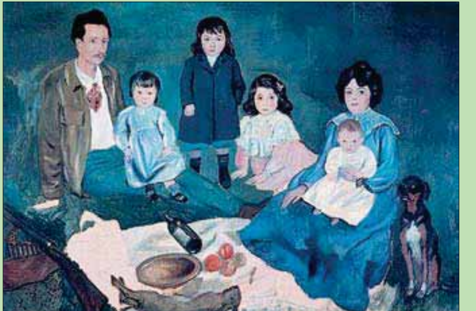
بابلو بيكاسو والعائلة

سبتمبر (أيلول) المقبل ويستمر لغاية السادس من يناير (كانون الثاني) 2020. ويحظى هذا الحدث الفني الكبير بدعم استثنائي من المتحف الوطني بيكاسو - باريس، في إطار مبادرته «بيكاسو - البحر المتوسط»، كما يحظى بدعم وزارة الثقافة اللبنانية. يتمّ تنظيم هذا المعرض بمنحة من دانيال إدغار دو بيتشوتو، إحياء لذكرى زوجها