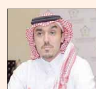
الأمير عبد العزيز الفيصل (الشرق الأوسط)

مبلغ (480 مليون ريال سعودي) يتم منحه للنادي 1700 في المملكة لتخفيف جهودها في تشييد مختلف الألعاب، وذلك بالارتكاز على مشاركتها والنتائج التي تحققت ضمن نظام «نقاط موحد» تم تصميمه خصيصاً لهذا الهدف. وسيتم توزيع الدعم المالي وفق عدد النقاط التي يحصل عليها النادي عبر أدائه في مختلف المسابقات في جميع الرياضات، وسيكون الموسم القادم نقطة الانطلاق باختيار 10 ألعاب مختلفة يصل مجموع نقاطها الإجمالي إلى 800 نقطة، وتشمل الألعاب