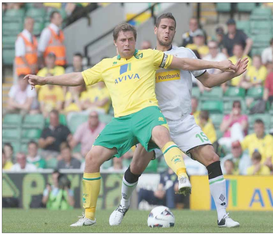
لعب هولت 171 نادياً من بينها نورويتش سيتي وشيفيلد وينزداي وسجل معها 192 هدفاً

انتوني بليكينغتون كان سيرفع الكرة، لأن هذا هو ما يفعله دائماً. وكنت أعرف أن ستيف موريسون وكنت أشكر بشكل رائع، لذلك نجح في إبعاد إحدى الكرات الخطيرة من أمامي. لقد كنت أنا في مواجهة اثنين من اللاعبين، وكنت أعرف أن حارس الرمي سيحاول الإمساك بالكرة لكنه لن ينجح في ذلك. لقد كنت أعرف كل ذلك، لأن اللاعب يتعلم مثل هذه الأشياء مع تقدمه في السن وحصوله على مزيد من الخبرات». ولو لعب هولت في الدوري الإنجليزي الممتاز في سن أصغر من ذلك، لكان من الممكن أن يستفيد من تدريب أكثر تطوراً، لكنه لم يكن ليكتسب المعرفة والخبرات التي ساعدته على العمل في مجال التدريب واكتشاف المواهب الشابة. ويشعر هولت بالقلق من أن جيلاً جديداً من اللاعبين لن يتعلموا تلك الدروس أبداً، لأن مسيرتهم مع كرة القدم تنتهي فعلياً عندما يبلغون الثالثة والعشرين من عمرهم. ويقول هولت: «لقد تغير كل شيء فيما يتعلق باللاعبين الصغار في السن. وبمضي السنين، أصبحت أرى أن اللاعبين الذين لم يتعلموا تلك الدروس أبداً، لأن مسيرتهم مع كرة القدم تنتهي فعلياً عندما يبلغون الثالثة والعشرين من عمرهم. ويقول هولت: «لقد تغير كل شيء فيما يتعلق باللاعبين الصغار في السن. وبمضي السنين، أصبحت أرى أن اللاعبين الذين لم يتعلموا تلك الدروس أبداً، لأن مسيرتهم مع كرة القدم تنتهي فعلياً عندما يبلغون الثالثة والعشرين من عمرهم. ويقول هولت: «لقد تغير كل شيء فيما يتعلق باللاعبين الصغار في السن. وبمضي السنين، أصبحت أرى أن اللاعبين الذين لم يتعلموا تلك الدروس أبداً، لأن مسيرتهم مع كرة القدم تنتهي فعلياً عندما يبلغون الثالثة والعشرين من عمرهم.