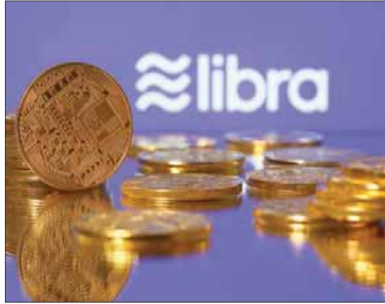
الشعار المقترح لعملة ليبرا التي أثار جدلاً واسعاً له «فيسبوك»

لـ «فيسبوك» يعني أن العملة المشفرة «يجب أن تكون آمنة وقوية ومرنة من أول يوم... إنها ليست عملية تجريبية: إما أن تنجح وإما لا تنجح». ويخشى المنظمون من أن «ليبرا» التي في تصميمها الأصلي ستسمح للمستخدمين بتحويل أموال باستخدام اسم مستعار. قد تستخدم لغسل أموال أو تمويل الإرهاب. وقال كور إن هناك حاجة إلى «مناقشة مستفيضة» بين الهيئات التنظيمية، حول كيفية تغيير القواعد الوطنية والدولية القائمة لتشمل «ليبرا».