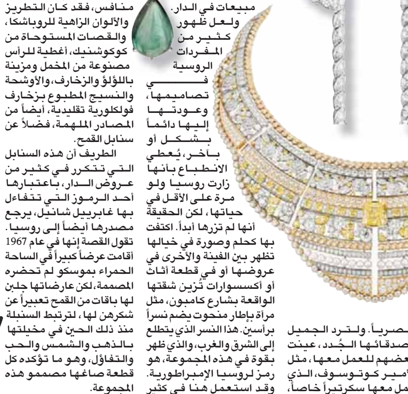
وتوظيفها 4 دوقات كحاشيات، وأخرى كعارضات أو كمسؤولات مبيعات في الدار. ولعل ظهور كثير من المفردات الروسية وتصميمها، وعودتها إليها دائماً بشكل أو بآخر، يعطي الانطباع بأنها زارت روسيا ولو مرة على الأقل في حياتها، لكن الحقيقة أنها لم تزرها أبداً. اكتفت بها كحلم وصورة في خيالها تظهر بين الفنية والأخرى في عروضها أو في قطعة أثاث أو اكسسوارات تزين شقتها الواقعة بشارع كامبون، مثل مرة بإطار منحوت يضم نسراً براسين. هذا النسار الذي يتطلع إلى الشرق والغرب، والذي ظهر بقوة في هذه المجموعة، هو رمز لروسيا الإمبراطورية. وقد استعمل هنا في كثير

من القلادات والبروشات والخواتم. ورغم أن الغلبة كانت له، فإنه لم يكن من دون منافس، فقد كان التطريز والألوان الزاهية للربوشا، والقصاصات المستوحاة من كوكوشنيك، أغطية للرأس مصنوعة من المخمل ومزينة باللؤلؤ والزخارف، والأوشحة والنسيج المطبوع بزخارف فولكلورية تقليدية، أيضاً من المصادر المهمة، فضلاً عن سنايل القمح.