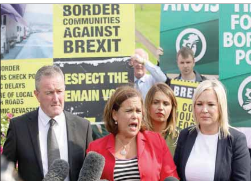
زعيم حزب شين فين الأيرلندي الجمهوري ماري ماكودال طلبت لندن أن تعرض على أيرلندا الشمالية إجراء استفتاء بشأن الانفصال عن المملكة المتحدة إذا سعت الحكومة للخروج من التكتل دون اتفاق

لكن الكثير من النواب المشككين في مؤسسات الاتحاد الأوروبي يعتقدون أن الآلية تمنح الاتحاد الأوروبي الكثير من السلطة على بريطانيا ورفضوا الاتفاق ثلاث مرات. ويعتقد مؤيدو بريكست أن الحواجز الإلكترونية يمكن أن تقام بعيداً عن الحدود، لكن لا تبدو أي خطة قابلة للتطبيق في الأفق. وقال فارادكار الجمعة إن بريكست جونسون هاتفاً أن بند شبكة «الأسمان» في اتفاقية انسحاب بريطانيا من الاتحاد الأوروبي «ضروري»، وأنه «لا يمكن إعادة التفاوض على الاتفاق». وأضاف أن لندن وبروكسل يمكنهما التفاوض على «ترتيبات بديلة» لتحل محل شبكة الأسمان إذا تركت بريطانيا للاتحاد الأوروبي بموجب اتفاق الانسحاب، الذي