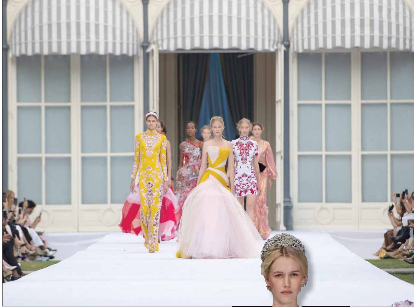
باريس، «الشرق الأوسط»

«رالف أند روسو» دار أزياء حققت في فترة وجيزة ما لم تحققه بيوت أزياء عريقة، فالإي جانب أنها أصبحت وجهة مالوفاً في عروض الأزياء العالمية، هي أيضاً مطلب سيدات المجتمع المخملي ونجمات هوليوود كلما أردن التألق بأزياء تميل إلى الفخامة في المناسبات المهمة. يمكن قوتها، كان ولا يزال هو تحريك العواطف وإثارة الأحلام، كما أن المصممة تمارا رالف وشريكها مايكل روسو شكلتا منذ البداية ثنائياً ناجحاً شبيهاً بالثنائي إيف سان لوران وبير بيرجيه تقريباً. تركز هي على نسج الأحلام بخيوط مترفة، بينما يركز هو على الجوانب اللوجيستية.