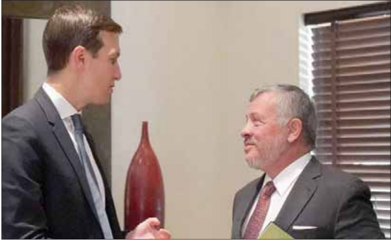
الملك عبد الله الثاني مستقبلاً جاريدي كوشنر كبير مستشاري الرئيس الأميركي ترمب امس

في مواجهة التطورات الخطيرة على الجانب الفلسطيني، وقيام سلطات الاحتلال بالاعتداءات المستمرة على المقدسات في القدس. كما أكدت المصادر أهمية اللقاء على صعيد التعامل مع التطور الأخير الذي قامت به سلطات الاحتلال من هدم منازل، في سابقة لم تحدث منذ عام 1967، ودلالات الفعل السياسية التي تقضي على قيام الدولة الفلسطينية على ترابها الوطني، وأن لا حل لكفل إنهاء الصراع سوى حل الدولتين. كان العاهل الأردني قد استقبل، الأسبوع الماضي، الرئيس الفلسطيني محمود عباس، قبيل إعلان الأخير وقف العمل بجميع الاتفاقيات مع إسرائيل، ليشهد عبد الله الثاني على رفض بلاده للممارسات الإسرائيلية المستترة على ترابها المحتلة، وهدم عشرات المنازل الفلسطينية، مؤكداً ضرورة تحرك المجتمع الدولي لوقف هذه الإجراءات التي تستهدف الهوية العربية للمدينة المقدسة. وأكدت مصادر سياسية فلسطينية في وقتها، ل«الشرق الأوسط»، أهمية تنسيق الموقف الأردنية الفلسطينية