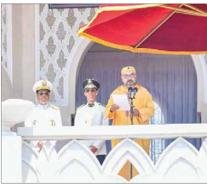
العاقل المغربي يترأس حفل أداء القسم للضباط المتخرجين من المدارس العليا العسكرية وشبه العسكرية في تطوان أمس

العبادة لأفراد القوات المسلحة الملكية بجميع مكوناتها، البرية والجوية والبحرية والدرك الملكي.