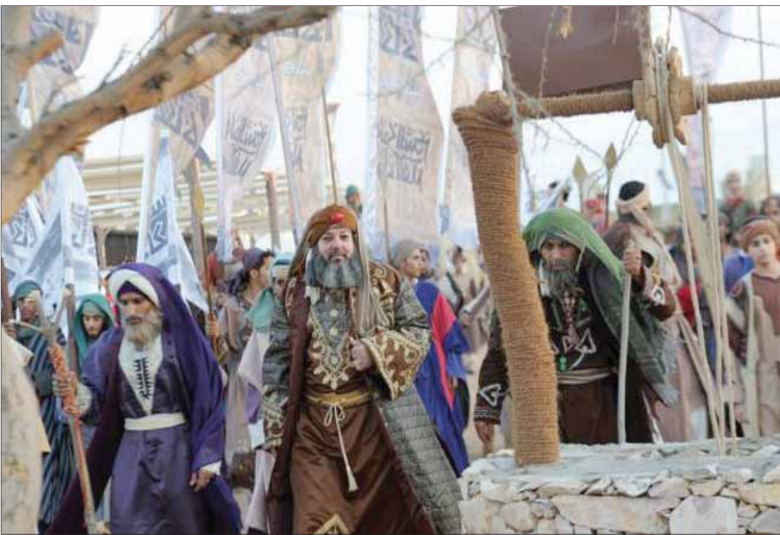
«السوق» يعدّ حاضنة اقتصادية واجتماعية وثقافية