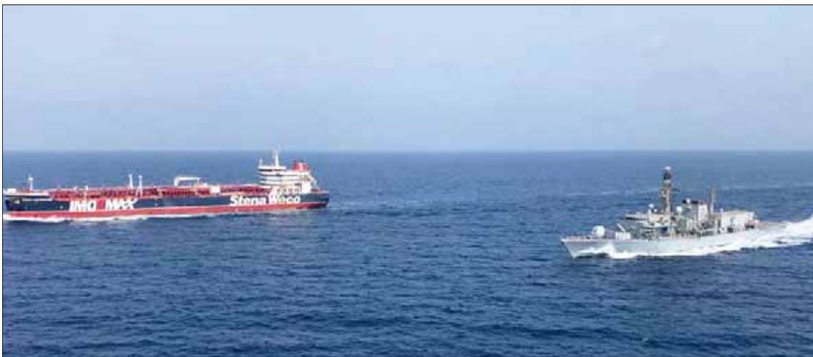
الفرقاطة «اتش ام اس مونترورن» ترافق ناقلة نفط بريطانية في مياه الخليج الخميس الماضي

المنامة: عبيد السهيبي لندن - الدمام، «الشرق الأوسط»