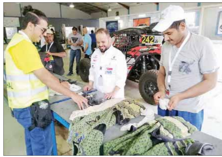
جانب من استعدادات المتسابقين لرالي عسير

بسبب عدد من الاحتياطات الأمنية في المناطق الصحراوية في مصر. وتابعت: قررت بعد ذلك التوجه للمسابقات خارج مصر، حيث شاركت في رالي أم القويين بالإمارات المتحدة في عام 2018 وعقبها عدة مشاركات خارجية حتى وصولي للولايات السعودية مسابقة رالي الفراعنة الدولي في عام 2015 وحققت الأولى على مستوى مصر وكان الرالي الأخير