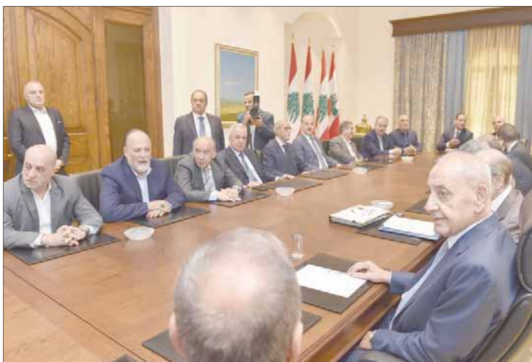
الرئيس نبيه بري خلال اجتماعه مع النواب أمس

بيروت، «الشرق الأوسط» أكد رئيس مجلس النواب نبيه بري أن المجلس سيبقي الحصن المنيع ضد أي انقسام، معتبراً أن 40 في المائة من التآزم الاقتصادي سببه الخلافات السياسية، وذلك خلال لقائه عدد من النواب في إطار لقاء الأربعاء النيابي.