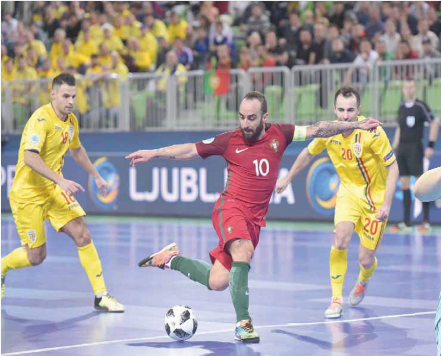
ريكاردينيو لم يختر كرة الصالات بل هي التي اختارته

يجلس في قاعة كرة الصالات بمجمع ريو مايور الرياضي على بعد 40 ميلاً إلى الشمال من العاصمة البرتغالية لشبونة، كيف يتأقلم مع كونه النجم الأبرز في كرة القدم الخماسية، بعد اعتزال النجم البرازيلي فالكاو، الذي يعد المثل الأعلى لريكاردينيو في هذه اللعبة، الذي يطلق عليه اسم «بيليه كرة الصالات».