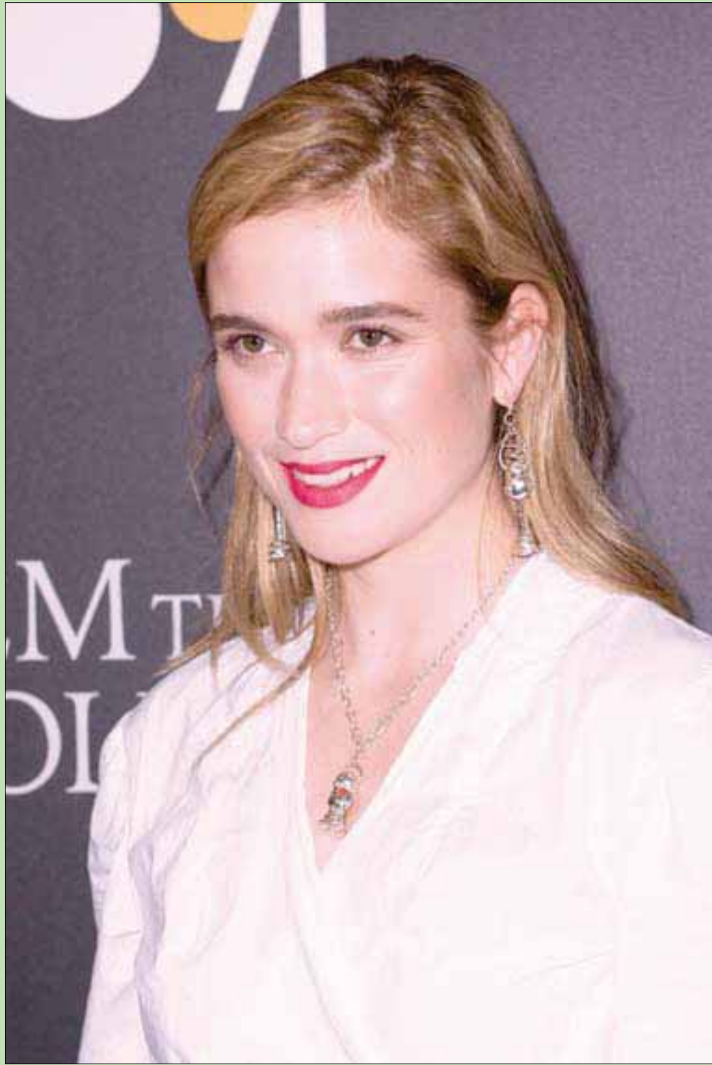
المثلة الأسترالية أليس إنجلتر تصل للعرض الأول لفيلم «هم يتبعون» في مسرح لاندمارك في لوس أنجلوس

لا بد أن استدرك وأقول: إنني فقط ضد من يتكسبون بالدين، ويتخذونه مطية لتنفيذ مآرهم الخبيثة المشبوهة، كـ«الإخوان» و«الدواعش» ومن جاراهم - والله وراء القصد.