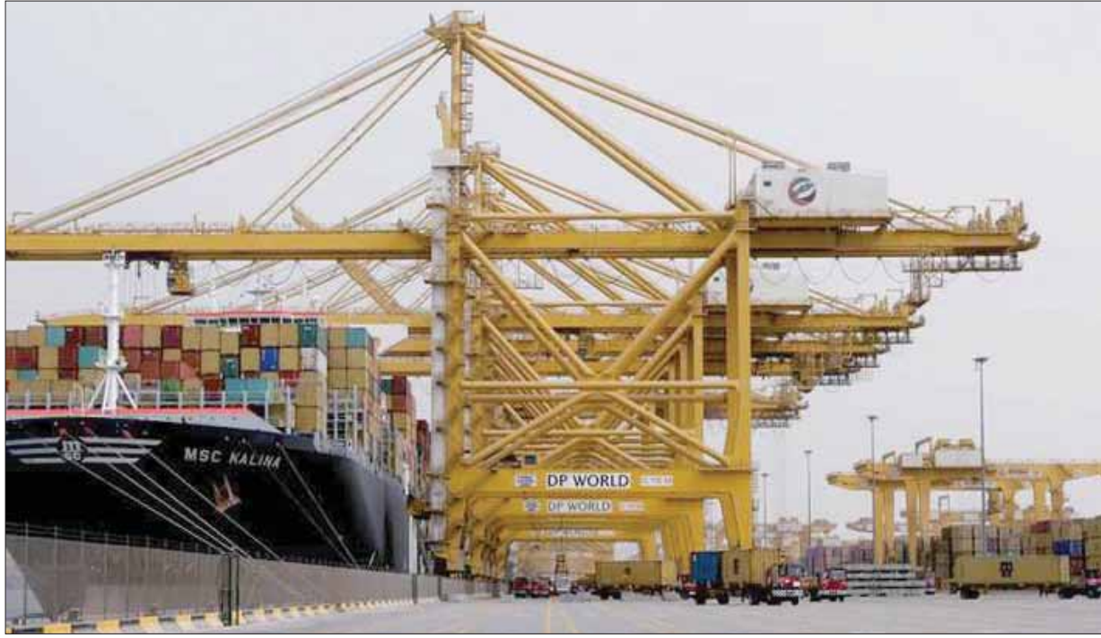
سفينة شحن تحمل حاويات بأحد موانئ دبي العالمية

القانونية، وذلك في ضوء الجهود غير القانونية التي تبذلها حكومة دبيوتى لإخراج «موانئ دبي العالمية» من جيبوتي، وتحويل عمليات الميناء لصالح الجانب الصيني.