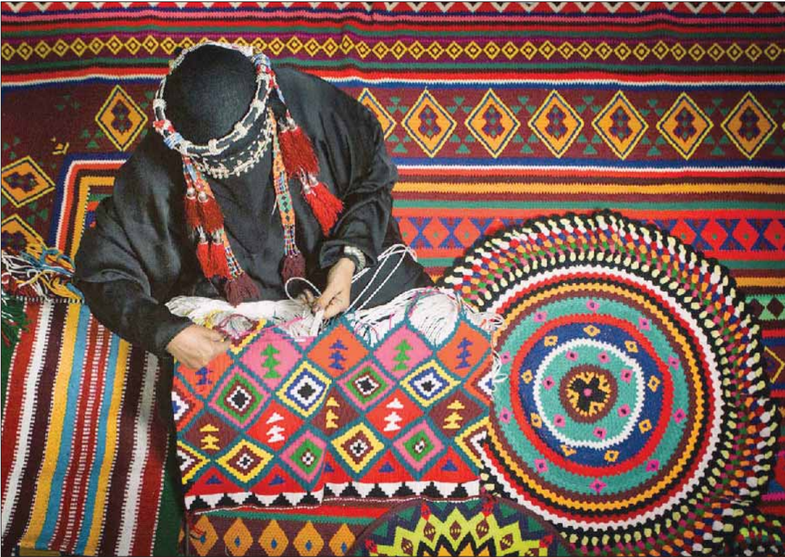
أكثر من 10 دول عربية تشارك في «السوق» بأجنحة كبرى