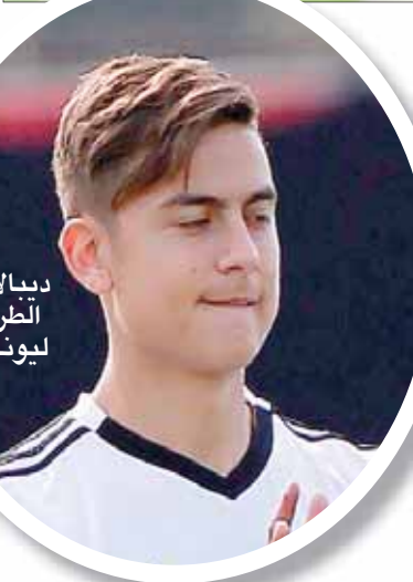
ديبالا في الطريق ليونايتد

وكان سولسكاير قد عزز صفوف «الشياطين الحمر» بلاعبين فقط حتى الآن هما المدافع الأيمن آرون وان-بيسكا من كريستال بالاس، والجناح الويلزي دانيال جيمس من سوانزي سيتي. وسيواحه يونايتد فريق ميلان الإيطالي يوم السبت المقبل في كأس الأبطال الدولية في آخر مباراة ودية قبل مواجهة تشيلسي في أولى جولات الدوري الممتاز في 11 أغسطس (أب).