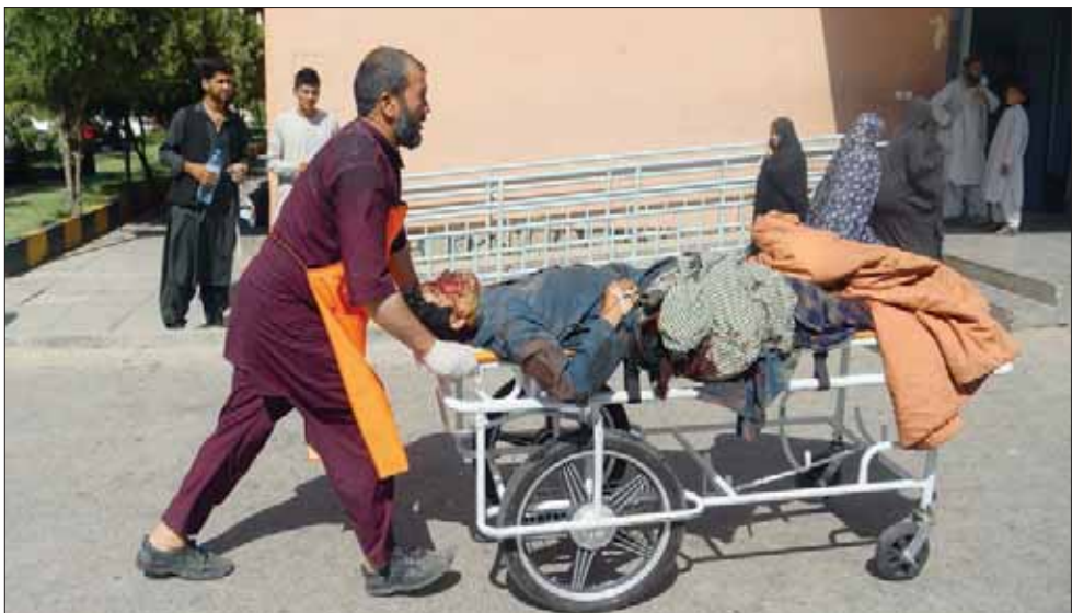
مسعف ينقل أحد المصابين في انفجار الحافلة إلى مستشفى بهيرات أمس