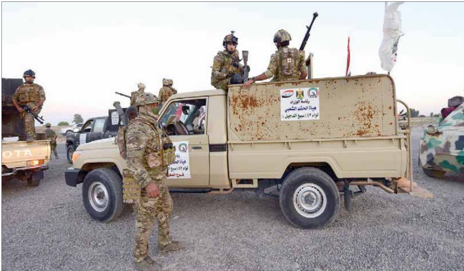
مسلحون من «الحشد الشعبي» في العراق