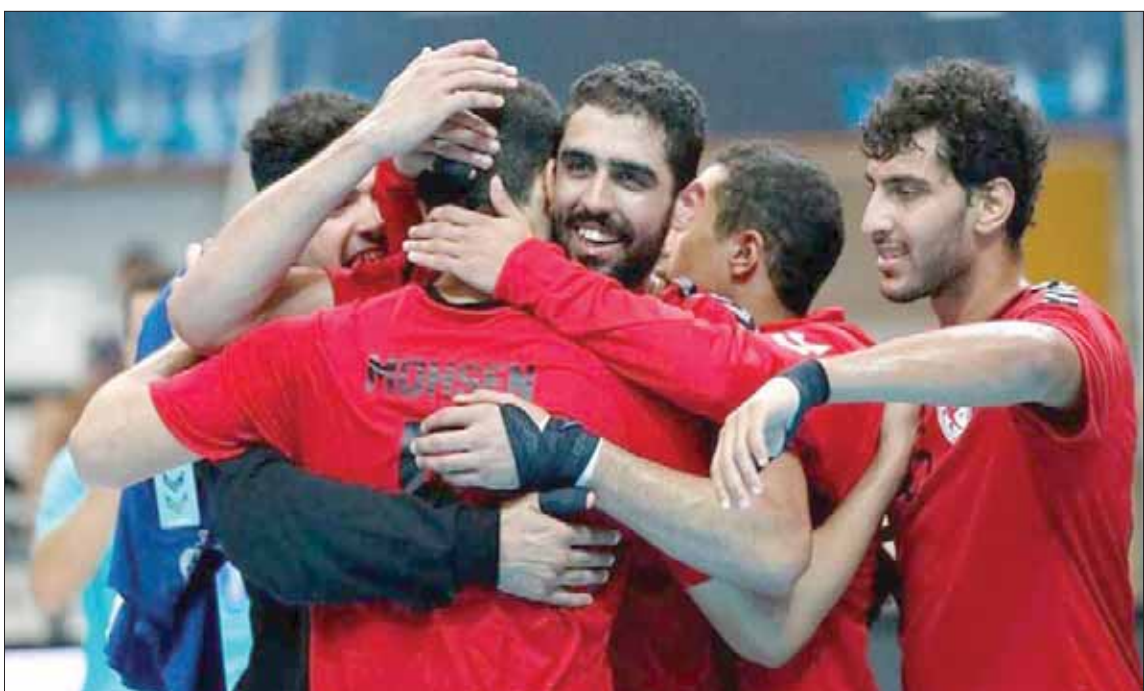
«شباب مصر» لكرة اليد حققوا إنجازاً تاريخياً في بطولة كأس العالم

وكان المنتخب الفرنسي توج بطلاً بعد فوزه على كرواتيا 28 - 23 في المباراة النهائية للبطولة. وبالعودة إلى مواجهة المنتخب المصري؛ فقد انتهى الشوط الأول بتقدمه 17 - 15، وفي الشوط الثاني تفوق واستطاع حسم اللقاء بفارق 10 أهداف.