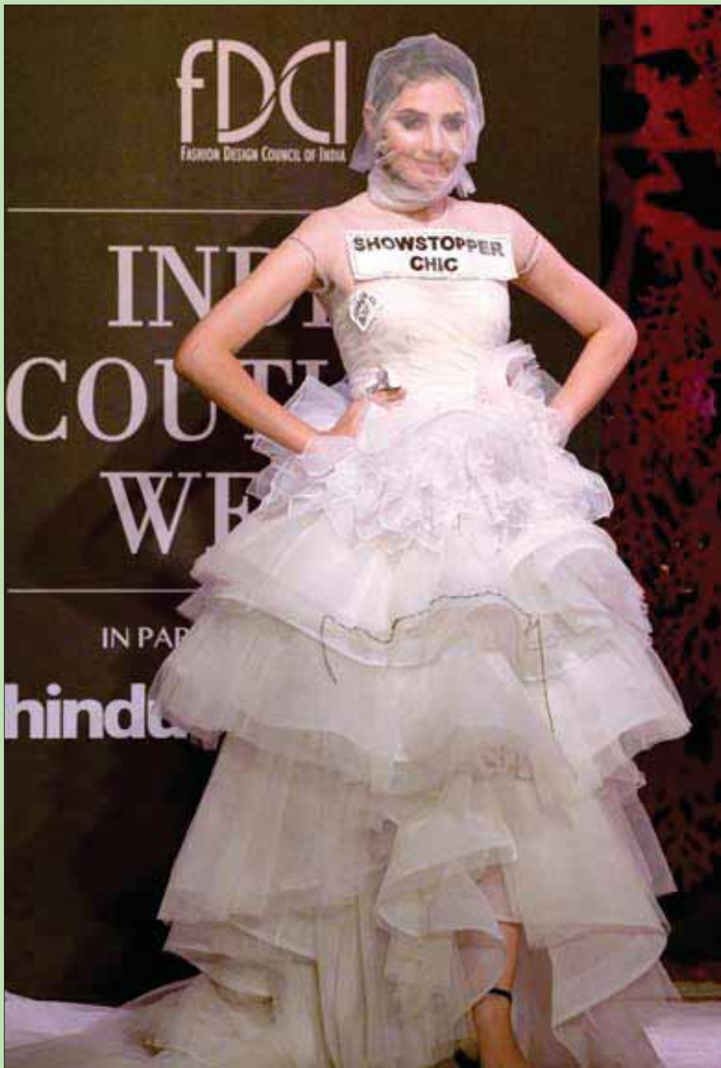
فستان من تصميم تارون تاهيلياني في اليوم الأخير من أسبوع الموضة في الهند

مع التقدير لبيان الإدارة الفلسطينية، لكن العمل الحقيقي يكون في تتبع أصول الداء... ومن يغذي هذه الترهات الشعبية الضالة، وينقلها لأجيال جديدة أقل علماً وأوفر رعونة.