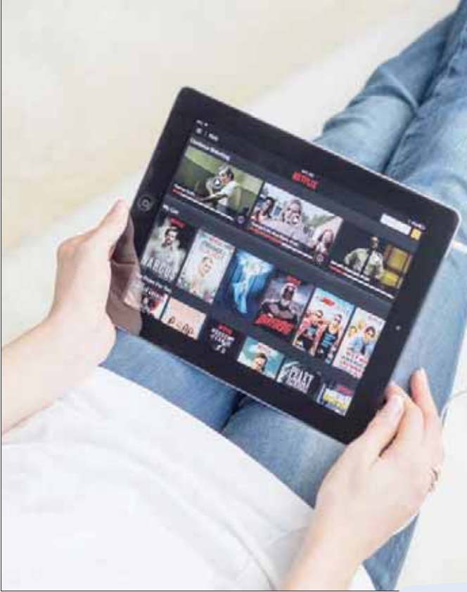
القنوات التقليدية تحاول المنافسة مع تطبيقات البث مثل «نتفليكس» و«أمازون برايم»

«نتفليكس»: وهي تقدم باقة من الأفلام والبرامج، وبعضها من إنتاج حصري للقناة وتقدم باقات من الاشتراك التي تبدأ من 5,99 إسترليني