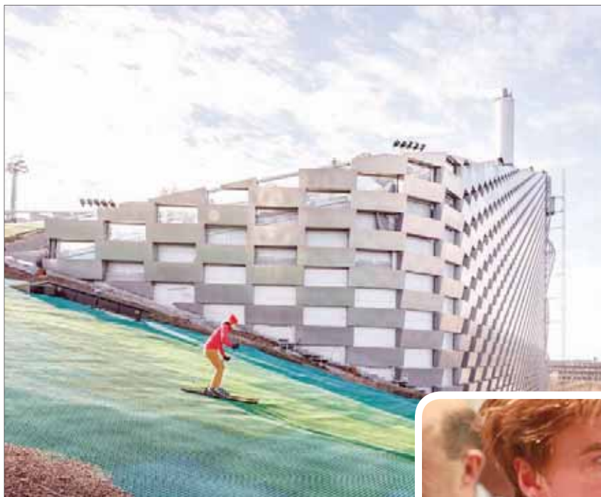
مشروع محطة لتوليد الطاقة ومنحدر للتزلج في كوبنهاغن

اعتقد أن انحصار النقاش الدائم حول الانهيار المناخي بإعلانات النيات والآراء هو أمر مخير للاهتمام. نحن أمام الكثير من التحذيرات الملحة ولكننا نفتقر إلى الحلول أو عناصر التحرك الفعالة والمحددة. وهذا بالطبع، لأن كوكبنا هو عبارة عن كيان واسع يشبه هدفاً هائل الحجم لا يمكن فهمه بشكل تام. دائماً ما أفكر بعمق بشأن الرؤية من الأعلى» على الأرض... لا شك أنه يحدث تحول إدراكي في أنفسهم.