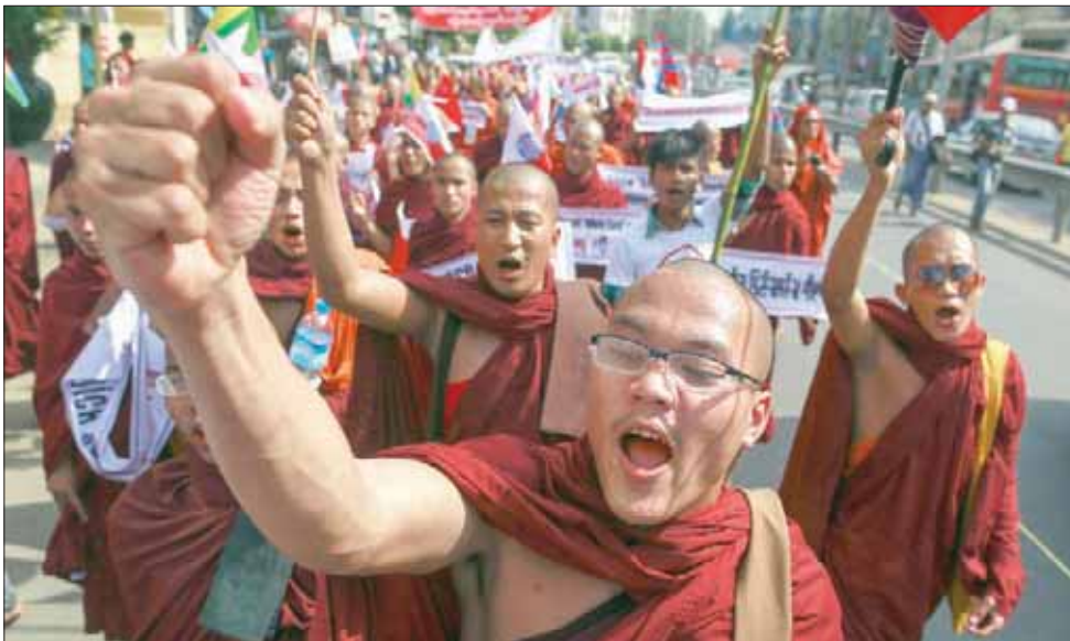
رهبان بوذيون يشنون مظاهرات احتجاج في أعقاب تفجيرات عيد الفصح بسريلانكا

مجلة «مغازين إنديا»، بالإشارة إلى أنه: «بالنظر إلى أنه من المقرر عقد انتخابات رئاسية في ديسمبر (كانون الأول)، وتبعتها انتخابات برلمانية وإقليمية، تعتمد الحركة الأصولية البوذية على التأكيد على نفوذها باعتبارها صاحبة الكلمة الأولى في سريلانكا».