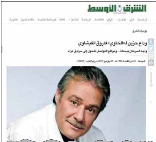
مؤسس تنظيم القاعدة أسامة بن لادن وقتله.

ونال مقال «خلي أعصابك في تلاجع» للكاتب عبد الرحمن الراشد، اهتمام القراء والذي يوضح فيه الكاتب رؤيته مع ما وصفه بـ«معركة الأعصاب» وسط الأجواء المتوترة التي يشهدها الخليج بعد عمليات الاعتداء وخطف الناقلات، وتهديد الملاحة.