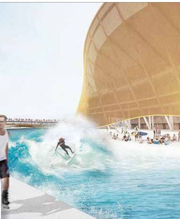
مشروع ملعب لكرة القدم مع مدينة مائية وشاطئ صناعي في واشنطن

شديدة النظافة لتوليد الطاقة يمكن تحويل سقيها إلى منحدر للتزلج، وممر للتحرك، وجدار للتسلق، أو منحرف يصلح أيضاً كجسر ممتد من إحدى جهات حديقة النحت إلى الأخرى. وفي دار «فانكوفر هاوس»، استخدمنا فنّ الشوارع لتحويل الجهة السفلى الباطنية من الجسر القائم إلى أثر فني شبيه بكثيثة سيسين في الفاتيكان. ● كيف تنعج الزبائن بالذباب بأفكارهم إلى ما هو أبعد مما قدموه أصلاً؟ - الهندسة المعمارية هي تحويل الخيال إلى حقيقة. إن