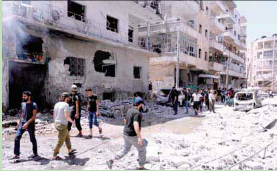
سوريون وسط الخراب بعد غارة لطيران النظام على إدلب أمس

ميدانيا، من المرجح أن يطغى التصعيد في إدلب على جدول جولة جديدة من محادثات استأنته تعقد هذا الأسبوع في العاصمة الكازاخستانية بحضور ممثلين عن طرفي النزاع، إلى جانب تركيا وروسيا وإيران. ويقول متخصصون في الشأن السوري إن استعادة النظام السوري السيطرة على إدلب لن تكون عملية سهلة، بل حرب استنزاف بطيئة للأسد. (تفاصيل ص 7)