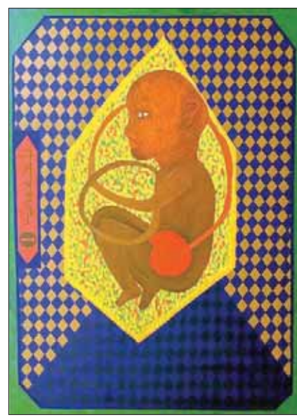
لوحة للفنان صلاح المر بعنوان «رائحة جنين»