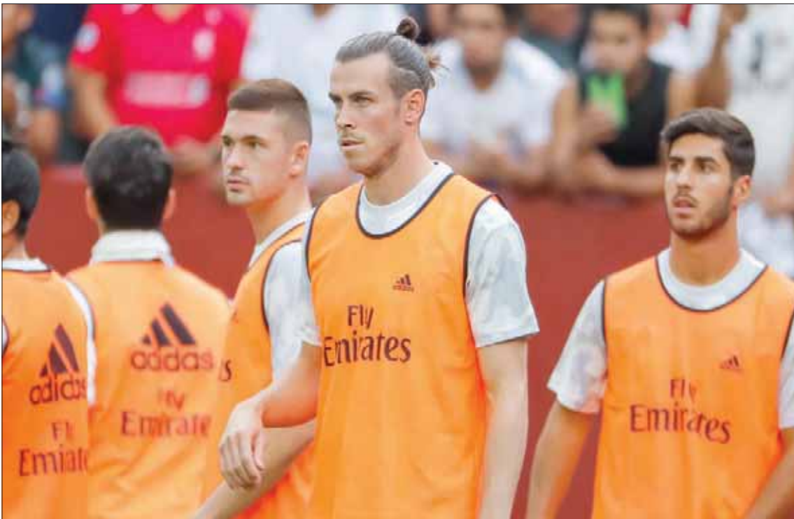
غاريت بيل ما زال مستمراً مع الريال رغم العلاقة المتوترة مع المدرب زيدان

وبحسب مصدر آخر، فإن باريس سان جيرمان حيث يحلم المهاجم العاجي الواعد، 24 عاماً، باللعب، دخل أيضاً سباق المنافسة على الصفقة، ولكن متأخراً لجذب الجناح الذي قدم موسماً استثنائياً مع ليل (سجل 22 هدفاً في 11 تمريرة حاسمة)، وستكون الصعوبة بالنسبة لسان جيرمان لحسم الصفقة في على الخصوص البقاء في دائرة اللعب المهني. النظيف. وسيخوض ليل الذي حقق مفاجأة في الموسم الماضي بحلوله وصيفاً بعد موسم واحد على تفادي الهبوط إلى الدرجة الثانية، مسابقة دوري أبطال أوروبا بعد غياب عنها دام سبعة أعوام.