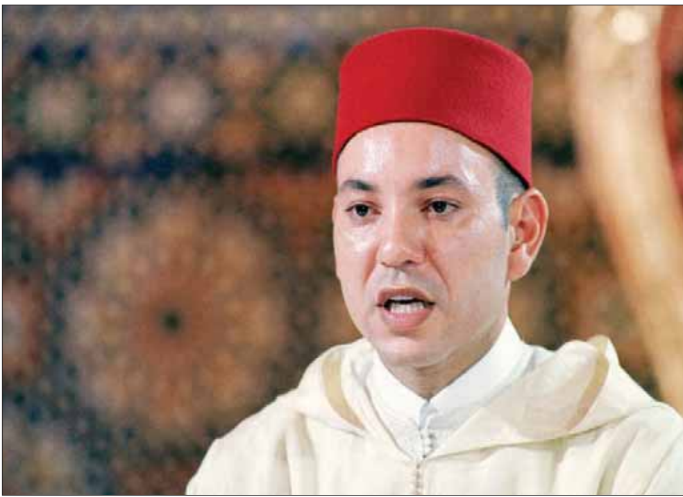
العاهل المغربي يلقي أول خطاب له بعد توليه الحكم

السياسية والعلاقات الدولية وعميد كلية العلوم القانونية والاقتصادية بمدينة تطوان، لـ«الشرق الأوسط»، إن الملك محمد السادس بعد اعتقاله العرش أعلن عن «المفهوم الجديد للسلطة» الذي حدد من خلاله تصوره للكيفية التي سيجتمع بها البلاد، وكانت هذه الخطوة إشارة قوية على رغبة الملك بإدخال إصلاحات جوهرية على النظام السياسي.