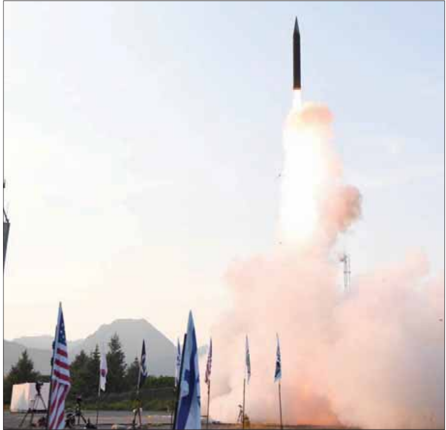
صور أطلقتها وزارة الدفاع الإسرائيلية لاختبار صواريخ «حيتس» المضادة للصواريخ بعيدة المدى في الأسكا

بعد الكشف عن الأمر في الإعلام، اعترفت وزارة الأمن الإسرائيلية، أمس (الأحد)، بأن «السر الأمني الكبير في الأسكا»، الذي تحدثت عنه وسائل الإعلام في الساعات الأخيرة يتعلق بتدريبات عسكرية أميركية - إسرائيلية مشتركة، أجرتها طواقم حربية من إسرائيل والولايات المتحدة، تم خلالها إجراء سلسلة تجارب ناجحة في ولاية الأسكا الأميركية على منظومة صواريخ «حيتس» المضادة للصواريخ بعيدة المدى، واعتراضها خارج الغلاف الجوي. وحسب بيان الوزارة، فإن هذه المنظومة اعترضت صاروخاً حقيقياً، للمرة الأولى. وقالت مصادر عسكرية إن الهدف كان تدمير صاروخ إيراني باليستي. وقالت الوزارة، في بيان رسمي لها، أمس، إن التجارب انتهت اليوم (الأحد)، وشملت اعتراضاً كاملاً لصاروخ هدف على ارتفاع بالغ خارج المجال الجوي، وجرى في ظروف سرية للغاية بمشاركة ممثلين عن الدولتين. وأنها هدفت إلى اختبار قدرات المنظومة التي لا يمكن تنفيذها في إسرائيل، وأكدت أن «التجارب على منظومة «حيتس» جرت بقيادة وقيادة الضباط الجوية الإسرائيلية، وبمشاركة الصناعات الأمنية وسلاح الجو الإسرائيلي».