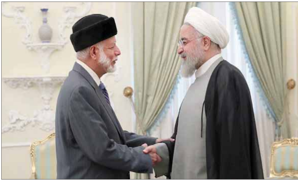
الرئيس الإيراني حسن روحاني يستقبل وزير الخارجية العماني يوسف بن علوي في طهران أمس

(الولايات المتحدة)». وكان بن علوي أجرى أول من أمس لقاءً منفصلين في أول أيام زيارته إلى طهران. وفيما لم تخرج تفاصيل لقاؤه بنظيره الإيراني محمد جواد ظريف، قال المجلس الأعلى للأمن القومي الإيراني إن بن علوي بحث مع علي شمخاني، سكرتير المجلس وممثل المرشد الإيراني، التوتري، الحالي في مضيق هرمز، خصوصاً الأزمة مع بريطانيا. وفي رابع محطة بطهران، أعاد بن علوي المحاور ذاتها للقاءاته والمسؤولين الإيرانيين مع رئيس البرلمان علي لاريجاني. وأفاد موقع البرلمان «خانه ملت» أمس بأن لاريجاني قال إن استراتيجيته بلاده الحالية هي «التقدم بأمن المنطقة»، لافتاً إلى أن «الأمن يتحقق على يد دول المنطقة، وتدخل الدول الأخرى يؤدي إلى نشوب مخاطر متوقعة».