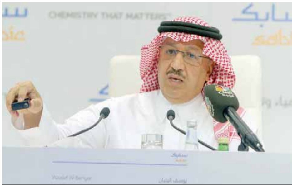
جانب من المؤتمر الصحافي للرئيس التنفيذي لـ«سابك» بالرياض أمس