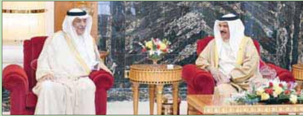
الملك حمد بن عيسى مستقبلاً وزير الخارجية السعودي إبراهيم العساف في المنامة أمس

إبراهيم العساف وقع اتفاقية المجلس التنسيقي مع نظيره البحريني الشيخ خالد بن أحمد آل خليفة في المنامة أمس، الذي سيتفرع عنه عدد من اللجان المتخصصة في شتى المجالات السياسية والعسكرية والاقتصادية والاستثمارية والإعلامية والاجتماعية وغيرها من المجالات الحيوية، لتحقيق الأهداف المرجوة من إنشاء هذا المجلس. وأكد الشيخ خالد آل خليفة أن إنشاء المجلس التنسيقي سيكون بمثابة انطلاقاً استراتيجية مهمة جديدة في العلاقات والتلاحم القوي بين البلدين، ومنصة محورية في تطوير التنسيق وتعزيز آليات التعاون الثنائي على جميع الأصعدة، وعلى هامش الاجتماع، قدم المهندس عماد المحيسن مدير عام المؤسسة العامة لجزر الملك فهد، عرضاً فنياً للخطوات المقبلة لمشروع جسر الملك حمد، وكذلك المشاريع المستقبلية لتطوير جسر الملك فهد.