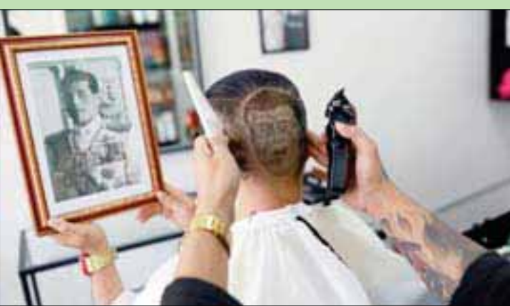
قصة شعر في صالون بياتوك

يحصل فيها ميتري، الذي صبح لحيته بلون أحمر وردي، على قصة شعر خاصة إذ رسم في إحدى المرات رئيس الوزراء ورئيس المجلس العسكري السابق برياوت تشان أوتشا.