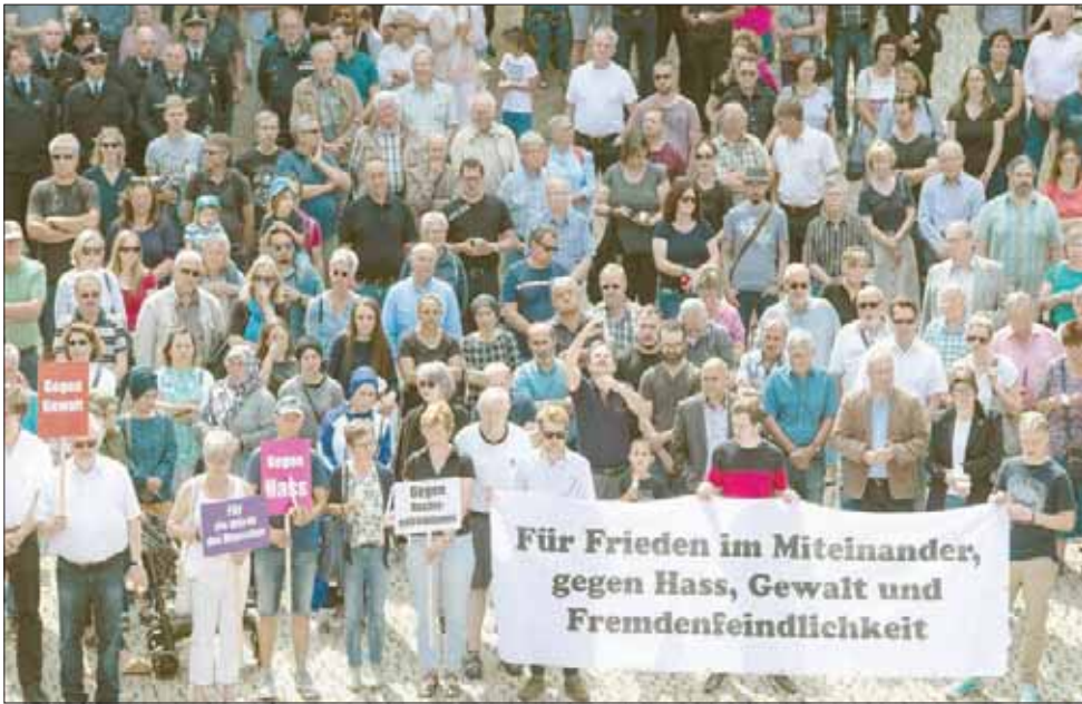
مواطنون ألمانيون في وقفة احتجاجية ضد اتساع ظاهرة التطرف اليميني في ألمانيا الشهر الماضي

أما مفوض الاتحاد الأوروبي للهجرة والشؤون الداخلية والمواطنة، ديمتريس أفرايموبولوس، فقد أكد من ناحيته أن وزراء الخارجية الأوروبيين قد عملوا على التوصل إلى استراتيجيات من شأنها مساعدة المهاجرين في ليبيا، وتنظيم عمليات النقل الإنسانية، وكذلك العودة الطوعية.