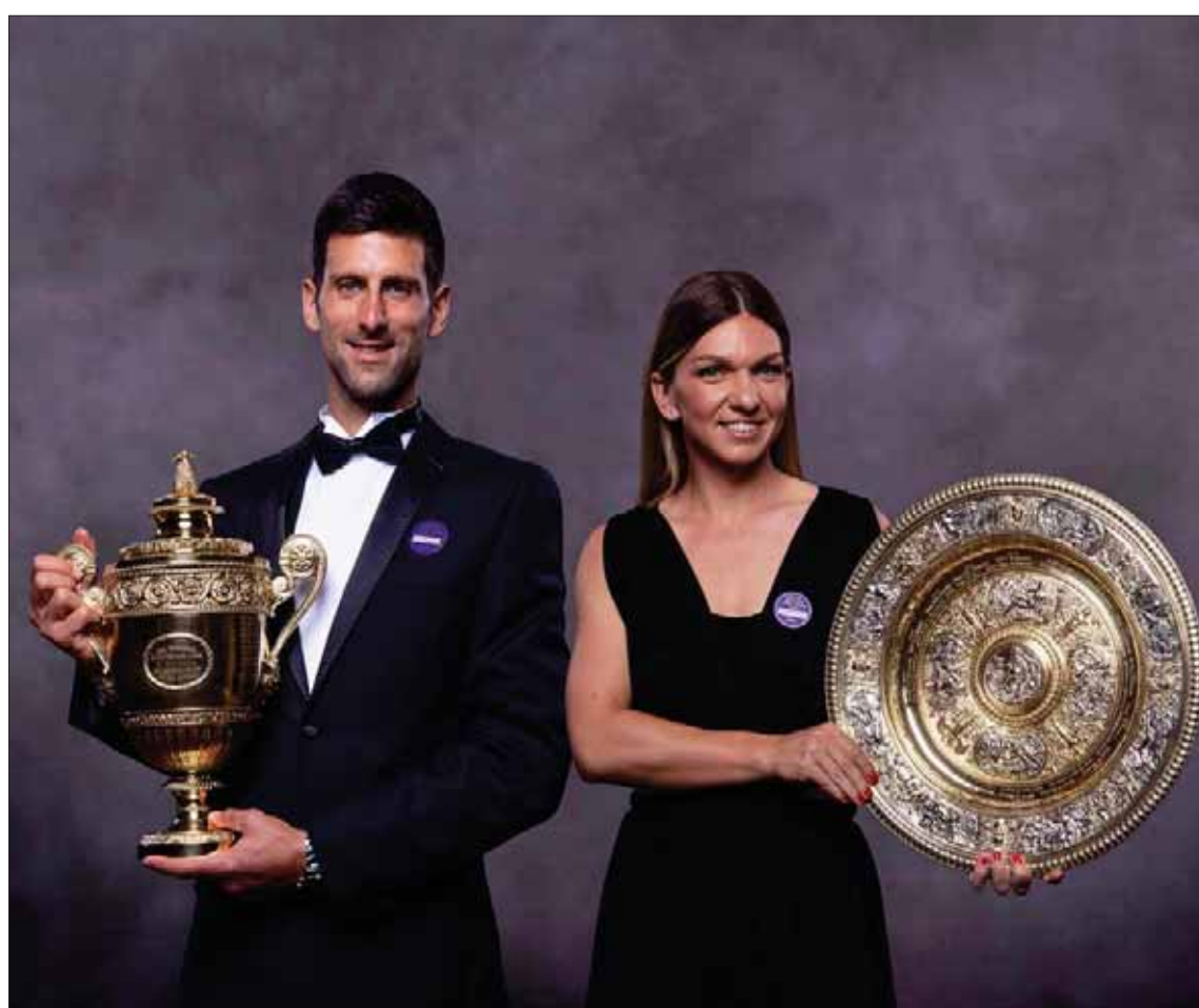
ديوكوفيتش فاز ببطولة ويمبلدون بعد نهائي استمر 4 ساعات و57 دقيقة بينما فازت هاليب بعد 56 دقيقة فقط (أ.ف.ب)

في لعبة التنس. وأصبح هذا أمراً طبيعياً للغاية لدرجة أن مجرد طرح سؤال حول هذا الأمر يجعل صاحبه يبدو وكأنه ينتمي إلى عصر الديناصورات. حصل على 2,3 مليون جنيه إسترليني، وحصلت الفائزة على بطولة السيدات، سيمونا هاليب، على المبلغ ذاته تماماً. وأصبح هذا المبدأ السائد لسنوات عدة الآن، ولم يعد هناك تمييز بين أجور الرجال والنساء في مستوى الصفاة