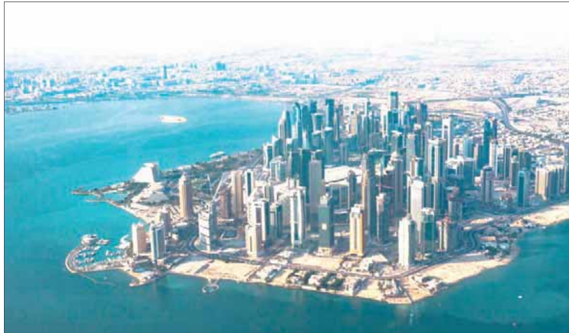
تواجه قطر تحديات في ارتفاع تكلفة الاستيراد مما يتسبب في تزايد مؤشرات التضخم (الشرق الأوسط)

الموظفين في شركات القطاع العام والقطاع الخاص بهدف تخفيض كبير للتكلفة. ورغم خطاب الشيخ تميم بن حمد آل ثاني أمير دولة قطر منذ سنتين، الذي أعلن فيه عن التوجه لبناء قطاعات عدة تدعم الاقتصاد الوطني، إلا أن ما حدث في الواقع أن بناء قطاعات استراتيجية صناعية تحتاج لعقود وسنوات للوصول إلى الاكتفاء الذاتي، والأسهل أن يتم استيراد المواد من صناعتها، نظرا للفاخرة الباهظة التي يمكن أن تتسبب بها إيجاد تلك الصناعات محليا، خاصة أن الحكومة لديها قنوات صرف عالمية خارجية بهدف تحقيق مكاسب لحظية لتحسين صورتها دوليا. وقال المستشار الاقتصادي سليمان العساف: «من الواضح أن هناك معاناة في الاقتصاد القطري في بعض القطاعات، وتابع العساف في حديثه لـ«الشرق الأوسط» أن قطر من أعلى الدول التي لديها ديون، في الوقت الذي تسعى فيه لمواجهة ذلك من خلال بيع الغاز، مشيرا إلى أن القطاع العقاري يعاني بسبب توقف الاستثمارات الخليجية وبالحدود المزدحم والإماراتيين والذين هم أعلى شريحة تستثمر في هذا القطاع بقطر. وقال: «استمرار المقاطعة العربية لهم سيكلفهم كثيرا، والتضخم مرتفع لارتفاع سبب الظروف المحيطة، مما يسبب ضغط كبير على بعض القطاعات في قطر».