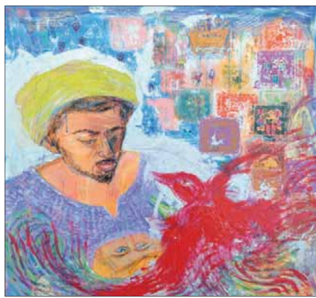
لوحة للفنانة ليلى أسامة تستلهم ابن بطوطة وعنوانها «رحلة البحث عن الذات»

رحلة ضمت دولاً عدة. أما الفنانة الرومانية بوليا موركوف، فتقدم للوهلة الأولى ما يبدو كخمس كروت بوستل سياحية تقليدية، ولكن مع الولوج لتفاصيلها يرى المتفرج أن الأماكن السياحية باللوحه تحترق بنيران من خطوط حمراء ومعالجات لونية تعكس قسوة الحياة، لولا قارب نجاة وحيد، وهو الحب بين البشر والتسامح.