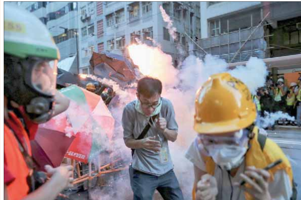
رد فعل صحافيين ومظاهرين بعد إطلاق الغاز المسيل للدموع في هونغ كونغ أمس

وتابع: «انظروا فقط، الحقائق تتحدث أفضل من الكلمات؛ الديمقراطيون دائماً يلعبون ورقة العنصرية، بينما هم لم يفعلوا سوى القليل جداً للسكان هذا البلد العظيم من الأميركيين من أصول أفريقية». وأضاف: «الآن وصلت البطالة إلى أدنى مستوى لها في تاريخ الولايات المتحدة، ويزداد الوضع تحسناً. إيلانجا كامينغز فشل بشكل ذريع».