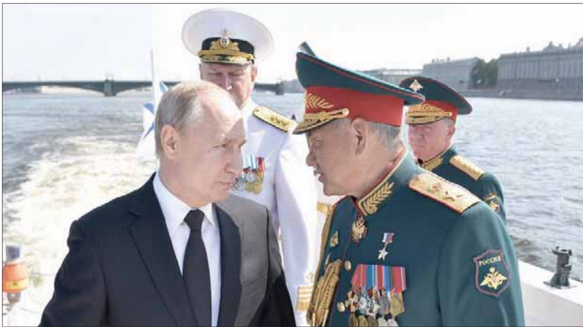
بوتين ووزير الدفاع سيرغي شويغو خلال إحياء يوم البحرية في سان بطرسبرغ أمس

عودة الرئيس فلاديمير بوتين إلى الكرملين بعدما تولى رئاسة الوزراء له سنوات. ودعا ناشطو المعارضة إلى تجمع جديد من أجل المطالبة بانتخابات حرة في نهاية الأسبوع المقبل.