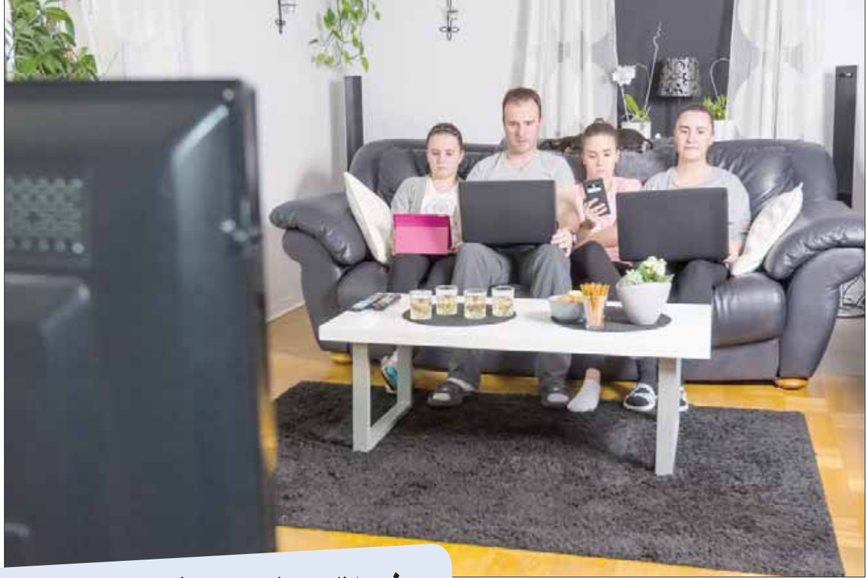
دخول خدمات جديدة إلى الأسواق تبعاً سوف يجعل الاختيار عسيراً على المستهلك