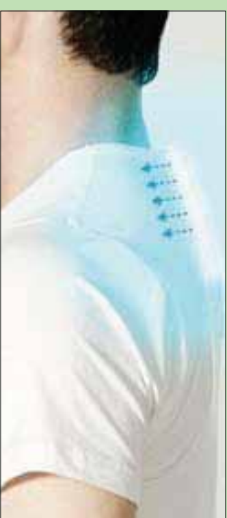
الجهاز يطلق تيار هواء (سوني)

القاهرة، حازم بدر تدفع التقلبات الجوية المتكررة حول العالم، المبتكرين إلى إطلاق حلول مستدامة وسهلة لمواجهة البرودة والحرارة على حد سواء، وأعلنت شركة «سوني» عن طرحها أوائل العام المقبل مكيف هواء شخصي يمكن وضعه في الجيب الخلفي العلوي لقميص مصمم خصيصاً له، بحيث يمكن استخدامه الاستمتاع بالبرودة صيفاً، والدفء شتاءً. ويشرح تقرير نشره موقع (techxplore) المعنى بالإخبار التقنية أخيراً، آلية عمل هذا المكيف، والذي يرتبط بجهاز الهاتف الذي يحمله الشخص، حيث سينتج تطبيق عبر هواتف «أندرويد» و«آي أو إس»، يمكن من خلاله التحكم في المكيف عبر «البلوتوث» سواء بزيادة درجة الحرارة في الشتاء، أو تخفيضها في الحر الشديد. وبينما تعاني العديد من دول العالم حالياً، لا سيما أوروبا ومنطقة الخليج، من ارتفاع غير مسبوق في درجات الحرارة، يقول مسؤولو «سوني» في التقرير إن «وحدة تكيف الجيب التي لا يتجاوز حجمها البطاقة المصرفية، تستطيع تبريد درجة حرارة الجسم بمقدار 13 درجة مئوية، حيث تشعر عند ارتدائها بتيار من الهواء البارد في منطقة الظهر، ويمكنك في الشتاء ضبطها