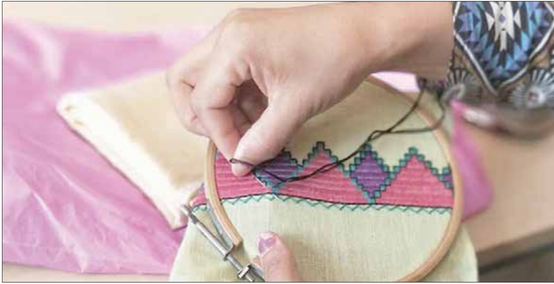
تتعلم النساء الأفغانيات التطريز وفنونه في سن مبكرة