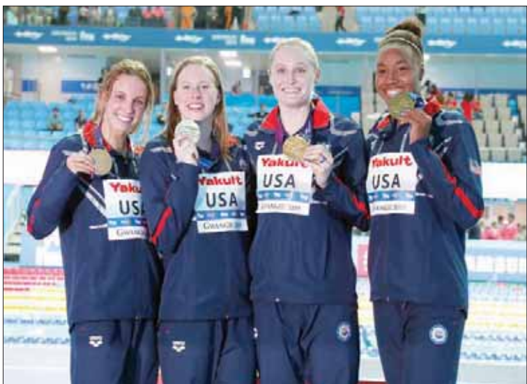
الفريق الأمريكي المتوج بذهبية التتابع

واكدت: «أخضع لاختبارات المنشطات كل 4 إلى 6 أسابيع، لذا لم أعط أي شيء محظور وأفعل ذلك في نفسي».