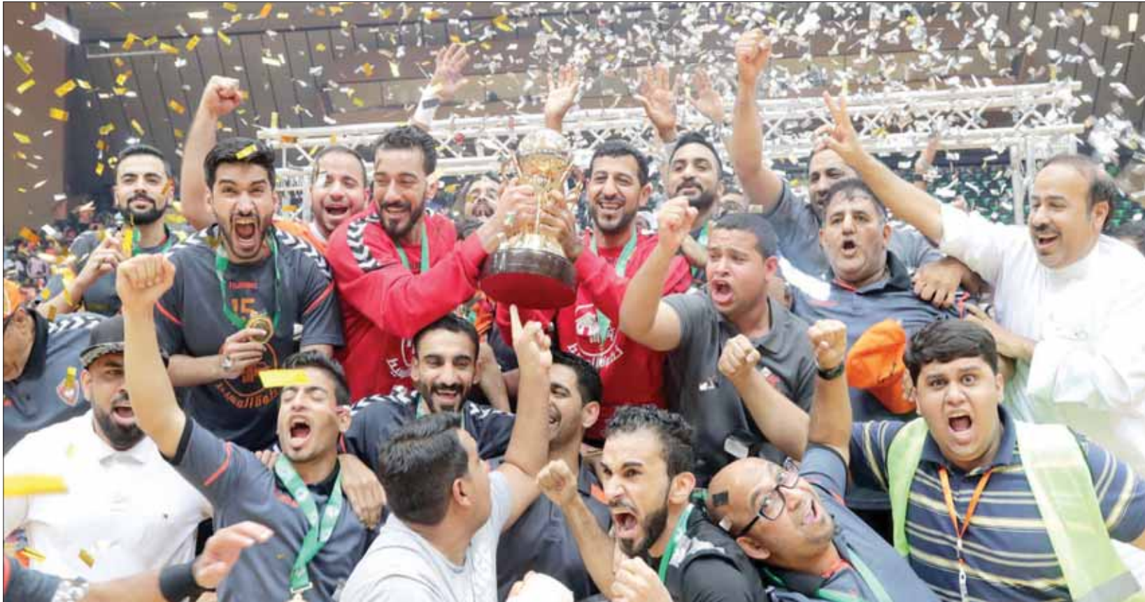
فريق مصر يتطلع لمنجز عالمي على أرضه رغم الأزمة المالية

بطولة «السوبر غلوب»، التي تقام في السعودية للمرة الأولى مما تمثل فرصة كبيرة لتحقيق منجز كبير يضاف إلى المنجزات السعودية في كل المجالات. وسيحضر نجوم كبار في هذه البطولة، خصوصاً في صفوف الفرق الأوروبية الثلاثة (برشلونة - فاراد - كيل)، والعديد من اللاعبين، الذين سبق لهم أن حققوا إنجازات كبيرة على مستوى البطولات القارية والعالمية، وكذلك الأندية ولهم صولاتهم وجولاتهم في الصالات التي تستضيف كبرى الأحداث.