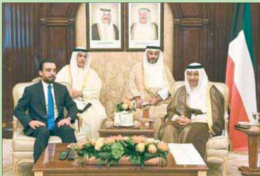
رئيس الوزراء الكويتي الشيخ جابر الصباح لدى استقباله رئيس البرلمان العراقي محمد الحلبوسي

ووجه بسرعة افتتاح قنصلية لدولة الكويت في محافظة النجف الأشرف، فضلاً عن مساهمته في بناء مراكز طبية متخصصة ومتطورة، لخدمة الزائرين في زيارة الأريبعين» من ناحية أخرى، كشف مجلس محافظة صلاح الدين عن إصدار أمير الكويت أمراً ببناء مدن سكنية، في 4 من أضية وتواحي محافظة صلاح الدين. وقال مجلس محافظة صلاح الدين، في بيان، أمس، إن «أمير الكويت أمر بتنفيذ الطلب الذي قدمه محافظ صلاح الدين عمران الجبر، ببناء مدينة سكنية في قضاء بيجي لخدمة متزائليهم، وأن تكون هناك مدن أخرى في عزين بلد وسليمان بك وبيرب». كانت الكويت تسلمت، الخسيس الماضي، 270 مليون دولار من العراق كتعويضات عن الأضرار التي لحقت به عن احتلاله لها عام 1991. وبحسب لجنة التعويضات التابعة للأمم المتحدة، فإنه ومع الدفعة الأخيرة، يكون العراق دفع إجمالي 48,7 مليار دولار، ليتبقى 3,7 مليار دولار من إجمالي المبلغ الكلي والمقدر بـ 52,4 مليار.