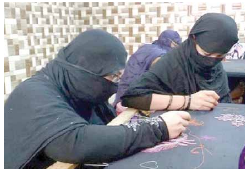
مبادرات لنساء أفغانيات في نيودلهي لإحياء الحرفة