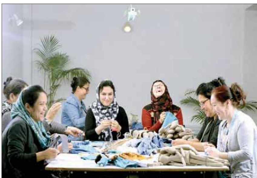
تروي الدمى التي تصنعها الأفغانيات قصص كفاح

وتتق هذه الدمى في العديد من المتاجر الهندية في كل من دلهي، وبنغالور، ومومباي، وكولكاتا، وغوا. واحتفالاً باليوم العالمي للأجانب، اختارت مجموعة متاجر «يونيكلو» اليابانية بيع منتجات مؤسسة «سبلايوالي» من الدمى في متاجرها كوسيلة من وسائل جمع المزيد من الأموال لصالح المؤسسة. كما يقوم متجر «انزنتستوك» للمنتجات اليدوية في مدينة زيورخ الألمانية ببيع تلك الدمى أيضاً. وفي المستقبل القريب، تخطط مؤسسة «سبلايوالي» لبيع الدمى في الولايات المتحدة الأمريكية عبر إضافة شخصيات جديدة مثل الحصان وفهد الثلج إلى المجموعة الحالية.