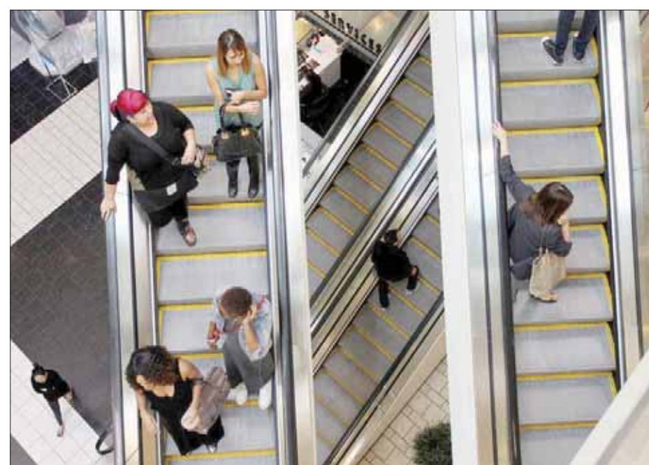
أسهم الإنفاق الاستهلاكي القوي خصوصاً على السلع المعمرة في الحفاظ على قوة الاقتصاد الأمريكي

حاليا على تغيير سياساته بعد أشهر قليلة من وقف المسؤولين لبرنامج التيسير الكمي، والاستعداد لإنهاء استراتيجية الخطوات التحفيزية الاستثنائية، حيث أرسل البنك إشارات تدل على الاتجاه إلى خفض أسعار الفائدة وتجدد عمليات شراء الأصول لدعم اقتصاد منطقة اليورو ضمن بيان السياسات الصادر عنه يوم الخميس الماضي، بما ترك المجال مفتوحا أمام إمكانية خفض معدل الفائدة على الودائع في سبتمبر (أيلول) عن مستواه القياسي الحالي البالغ (سالب) 0,4 في المائة. كما تزايدت التوقعات بشأن انتظار البنك المركزي حتى أحيان سبتمبر قبل إعادة تقديم التدابير التحفيزية بما قد يتنجح المزيد من الوقت للكشف عن قرار مجلس الاحتياطي الفيدرالي قبل تحديث التوقعات الاقتصادية للبنك المركزي الأوروبي.