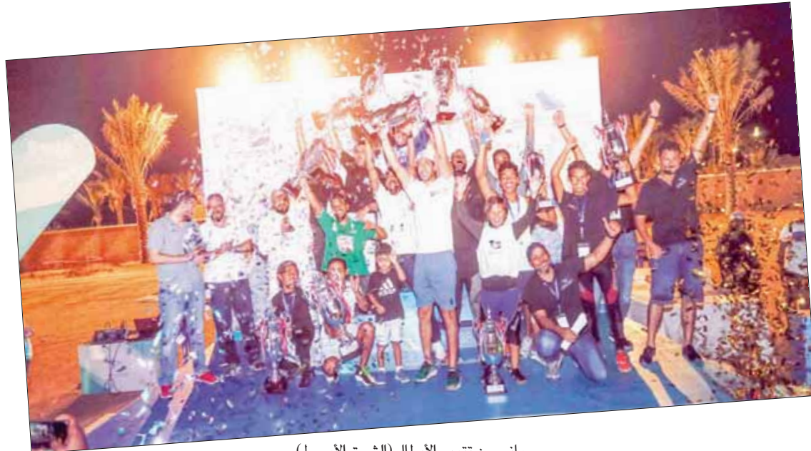
جانب من تتويج الأبطال

وصالة السينما رباعية الأبعاد (كي - ماكس) وحلبة جمنا كارتنج وغيرها، هذا بالإضافة إلى عروض الإقامة في الفنادق الفاخرة داخل المدينة والتي تقدم تجارب استثنائية للزوار ببرامج سياحية متكاملة.