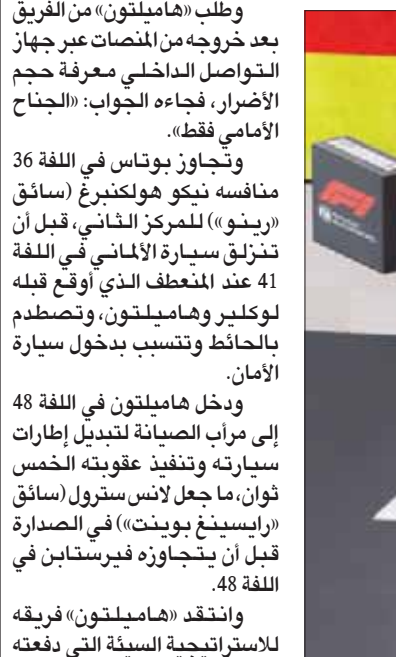
فيرستابن يحتفل على منصة التتويج الألمانية

في اللفة الثانية بتجاوزه رايكونن، وانهمرت الأمطار بكثافة، وفي اللفة «29» ارتكب سائق «فيراري» شارل لوكلير من موناكو، الذي كان انطلق عاشرًا وتقدم للمركز الثالث خطأ أدى إلى خروجه عن المسار واستدعى دخول سيارة الأمان.