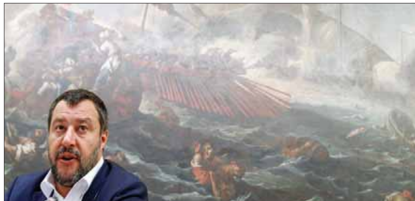
سالفيني لدى عقده مؤتمراً صحافياً في مجلس النواب الخميس الماضي

الإيطالية، قبل أن يتراجع ويعطي الضوء الأخضر بعد 10 أيام، لكن مجلس الشيوخ رفض الداخلية، بفضل دعم حلفائه من حركة النجوم الخمس في الحكومة الائتلافية. ويفيد استطلاع نشرته أمس (الأحد) بعض وسائل الإعلام الإيطالية بأن شعبية سالفيني انخفضت جراء مواقفه الأخيرة المتشددة في ملف الهجرة، التي زادت من عزلة إيطاليا في محيطها الأوروبي، لكن الجهات السياسية والأوساط الشعبية المعارضة على سياسته بدأت تتحرك بمزيد من التنظيم والنشاط، وهي تحضر لاحتجاجات حاشدة ومحاسبة قانونية في الداخل والخارج. ويسقوّل غاسباريه