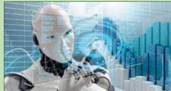
الذكاء الصناعي يعد تقنية للتعرف على الأنماط المعقدة والمنظّمون، الذين ما زالوا يصارعون سلبيات عصر الإنترنت