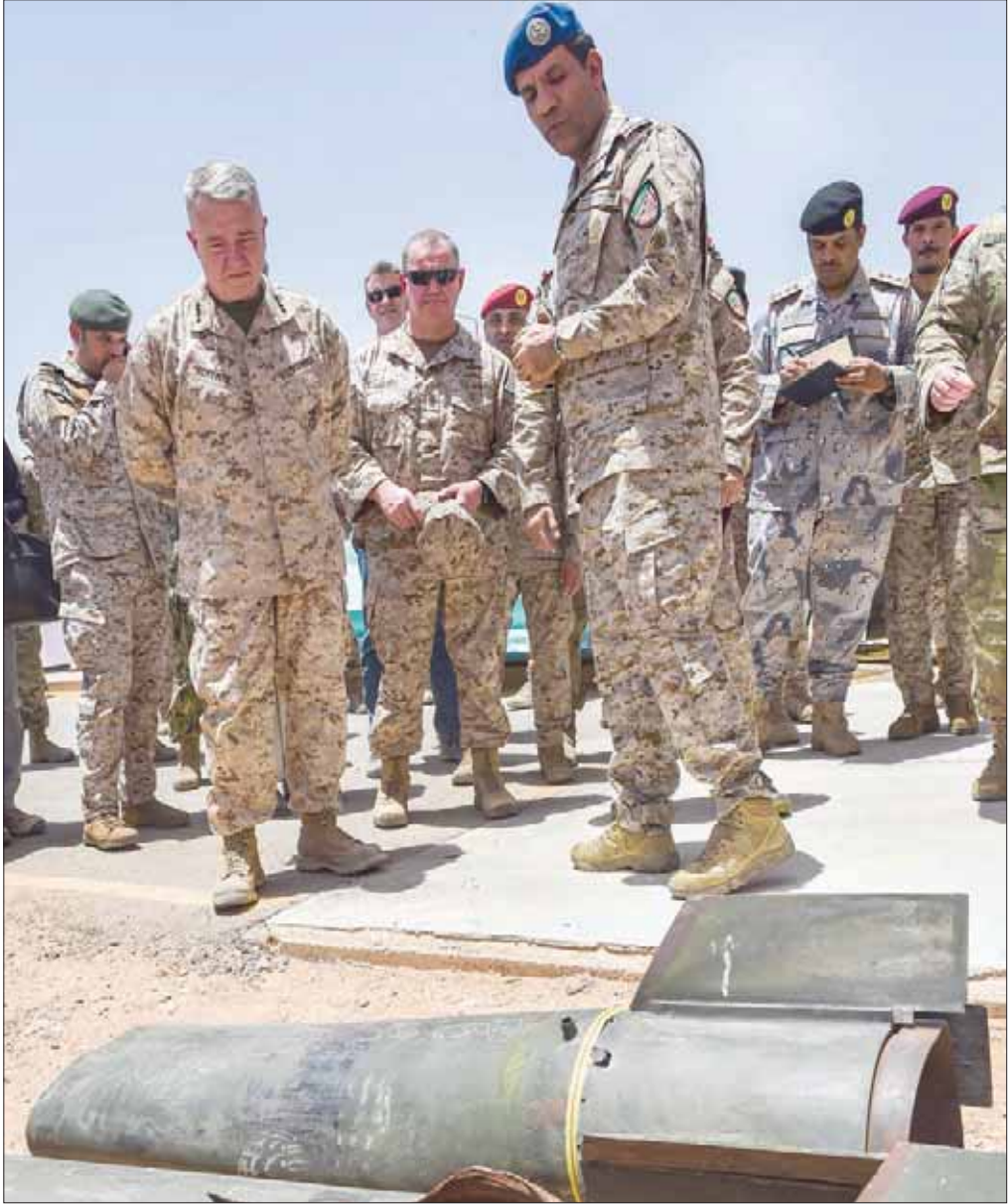
العقيد المالكي لدى عرضه صواريخ حوثية لقائد القيادة المركزية الأميركية خلال زيارته الخرج في 18 يوليو الحالي

وقال لـ«الشرق الأوسط» إن «المعارك انتقلت إلى منطقة يعيس، بعد إحراز الجيش تقدمه والسيطرة على مواقع ومرقعات استراتيجية أبرزها حصن شداد والرديمان في مريس»، مضيفاً أن «الجيش أفضل محاولات الانقلابيين