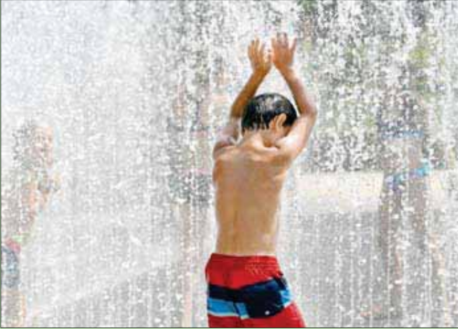
طفل يتبرد خلال يوم مشمس في نافورة متحف ريجك في أمستردام

بالإضافة إلى ذلك، تراجع مسعى لقوده فرنسا وألمانيا لتبني الاتحاد الأوروبي لهدف مشابه إلى مجرد ملحوظة فرعية في بيان خلال قمة في بروكسل، بعد معارضة بولندا وجمهورية التشيك والمجر. ولا يزال الرئيس الأميركي دونالد ترمب، ملتزماً بانسحاب بلاده، ثاني أكبر دولة مسببة للانبعاثات في العالم، من اتفاقية باريس تماماً.