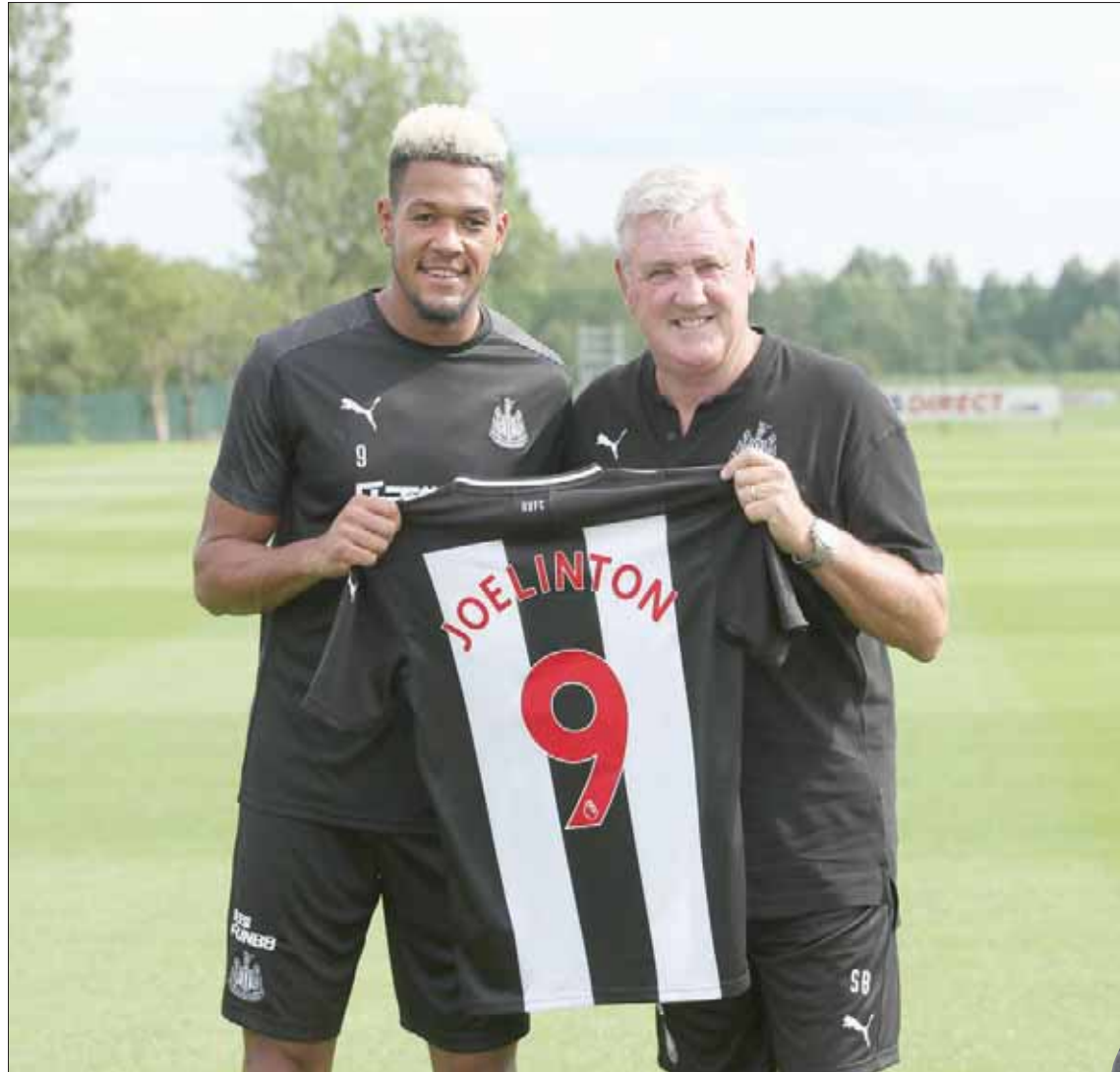
بروس يقدم البرازيلي جوليونتون أبرز صفقات نيوكاسل الجديدة في عهده

وقال بروس: «لن أكون في عالم التدريب. وفي الواقع، قام بروس بتغيير طريقته في التدريب منذ إقالته من تدريب سنديرلاند في نوفمبر (تشرين الثاني) 2011، وأثبت أنه مدير فني جيد ولديه لمسة إنسانية رائعة، لكن من المهم أيضاً أن تشير إلى أنه لا يرتقي إلى مستوى بينيتيز من حيث الاهتمام بألقاب اللاعبين والصفات التي يميز الإسباني عن الكثير من أقرانه في عالم التدريب التي جعلته يحصل على الكثير من البطولات والألقاب مع بروس. رغم أن بروس يصغر بينيتيز بثمانية أشهر، فإن المدير الفني الإنجليزي البالغ من العمر 58 عاماً ينظر إليه دائماً على أنه من أصحاب الفكر القديم