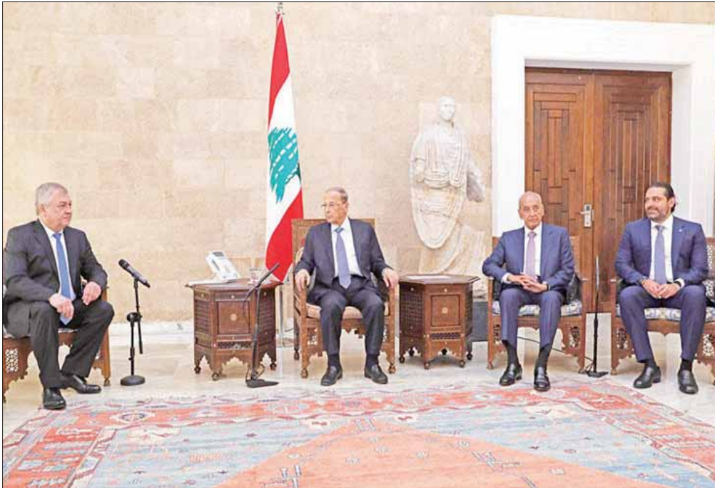
مبعوث بوتين مع الرؤساء الثلاثة في قصر بعيدا (الاتي ونهرا)

يلتقي لبنان دعوة تلقاها للمرة الأولى من روسيا لحضور جولة جديدة من مسارات آستانة، الذي سيعقد في 1 و2 أغسطس (آب) المقبل، والمخصص للبحث في الحل السياسي للأزمة السورية.