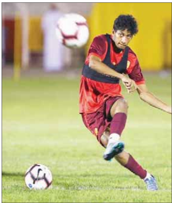
أحمد الزين (الشرق الأوسط)