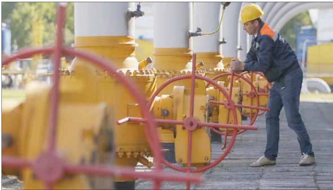
يرفض «الأوروبي» الاعتماد على شبكات أنابيب تسيطر عليها روسيا وجدها لنقل الغاز (رويتزر)