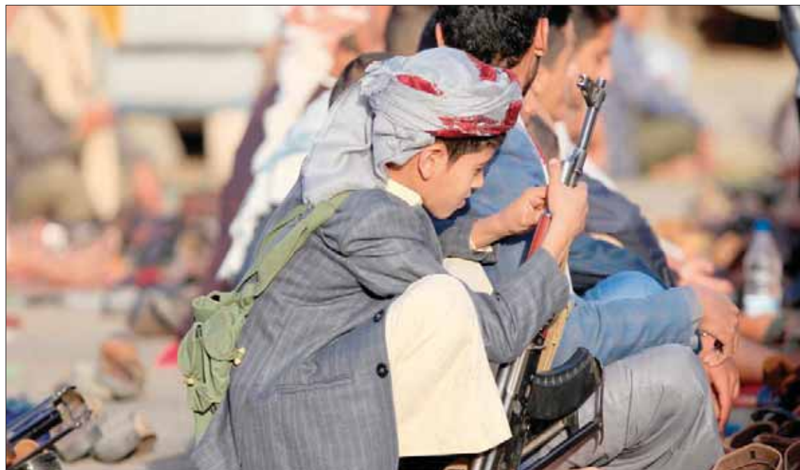
طفل يمني في صنعاء يحمل سلاحاً

ظاهرة اختطاف الأطفال بالعاصمة صنعاء خلال الآونة الأخيرة. ويقول الناشط بشبكات التواصل الاجتماعي، لـ«الشرق الأوسط»، إنه لا يمر يوم إلا ويقرأ أكثر من 4 إعلانات عن اختفاء أطفال من أحياء متفرقة في صنعاء.