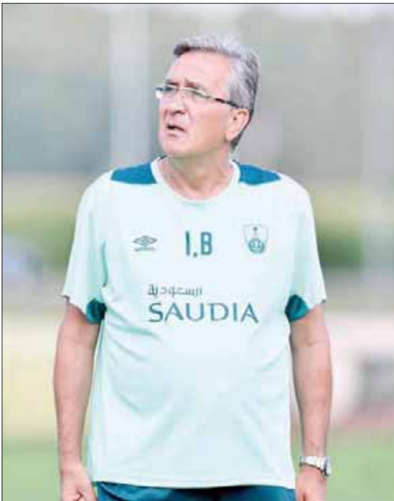
برانكو مدرب الأهلي

عائد لظروف الطيران، الجدير بالذكر أن اللاعب باولو ديزان المدافع الدولي التشيلي والمحترف في صفوف فريق الأهلي تم منحه إجازة خاصة بعد الفراغ من المشاركة مع منتخب بلاده تشيلي في كأس كوبا أميركا والتي انتهت مؤخراً في البرازيل وغادرها المنتخب التشيلي من دور نصف نهائي البطولة. وركزت وسائل الإعلام المختلفة الأرجنتينية والتشيلية خلال الساعات الماضية رفض اللاعب السفر إلى جدة للحاق بتدريبات فريقه الأهلي وأن اللاعب قرر البقاء حتى انتهاء المفاوضات نهائياً بين ناديه ونادي ريفر بلايت الأرجنتيني الذي يرغب في الاستفادة من خدماته رغم رفض ناديه العرض الأخير المقدم من النادي الأرجنتيني الشهير.