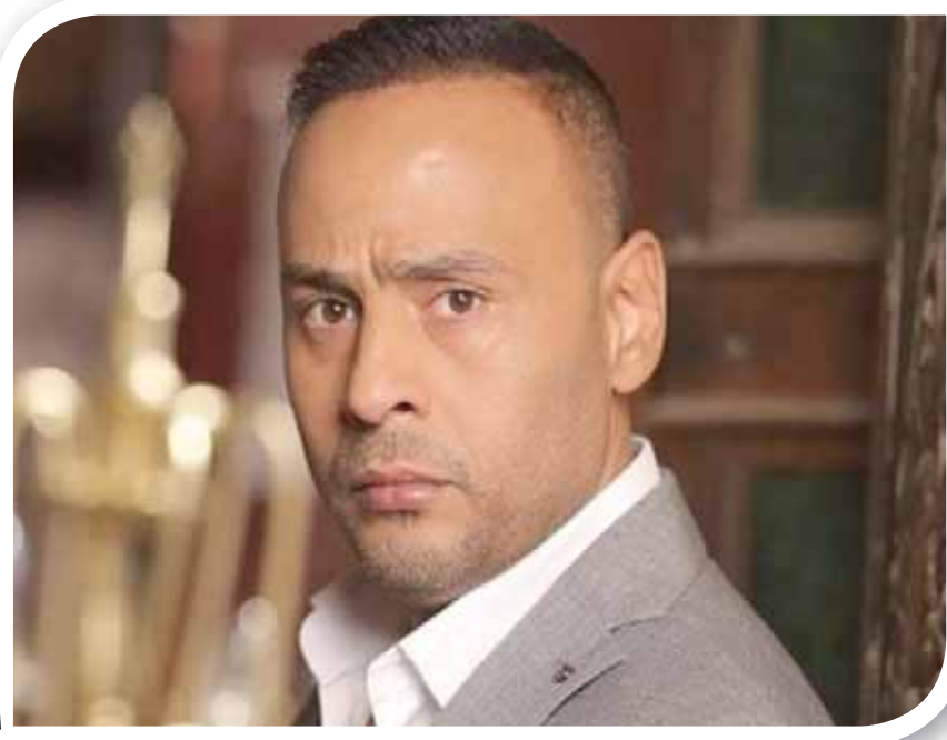
الفنان المصري محمود عبد المغني

«كرم الكينج» لم يحقق نفس نجاح سابقه، ولم يحصل إيرادات مرضية إطلاقاً، ومع الأسف الناس دائماً ما يتذكرون آخر شيء بغض النظر عن الماضي مهما كان ناجحاً.