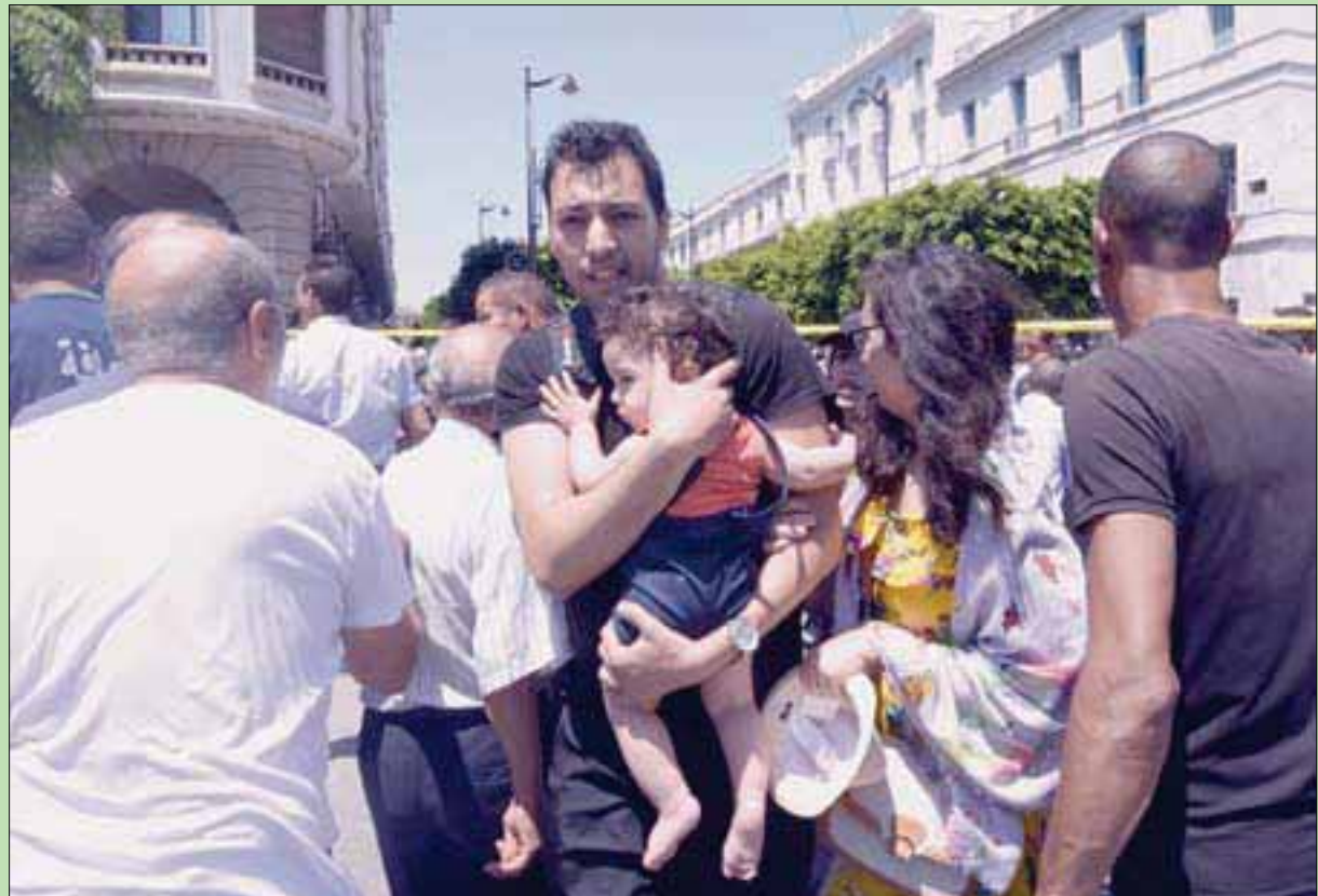
تونسيون في حالة صدمة بعد أحد الهجوعين الانتحاريين في شارع شارل ديغول في العاصمة أمس

وقالت وزارة الداخلية إن شخصاً فجر نفسه بالقرب من دورية أمنية بشارع شارل ديغول، ما أسفر عن إصابة 3 مدنيين واثنين من عناصر الشرطة، أعلن لاحقاً عن وفاة أحدهما متأثراً بجراحه. وفي وقت لاحق، أعلن تنظيم «داعش» مسؤوليته عن الهجمات في العاصمة التونسية، في بيان بثته وكالة «اعماق». وهذه هي المرة الأولى التي تتعرض فيها العاصمة لاعتداءات، منذ تلك التي وقعت في 30 أكتوبر (تشرين الأول) الماضي على جادة بورقيبة، وبنفذه انتحارية، ما أسفر عن 26 جريحاً، غالبيةهم من رجال الشرطة. (تفاصيل ص 9و10)