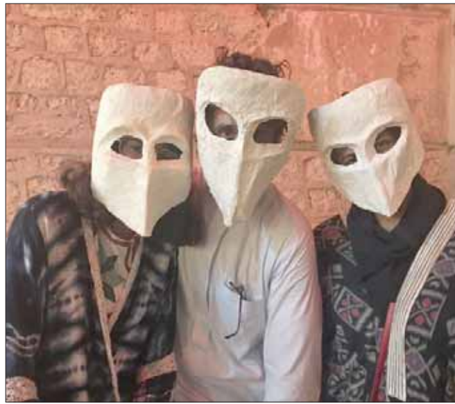
الفنانون بأزياء المسرح أثناء أداء أحد المشاهد

وعرض «بيت الدهاليزي» من كتابة الدكتورة لمياء باعشن، في إطار معرفي للمسرح التفاعلي ليكون جزءاً من التنمية الثقافية للمجتمع، عبر إيصال رسائل متنوعة في تحقيق الثقافة عبر التشاورية في المكان والنصوص والأدوات.