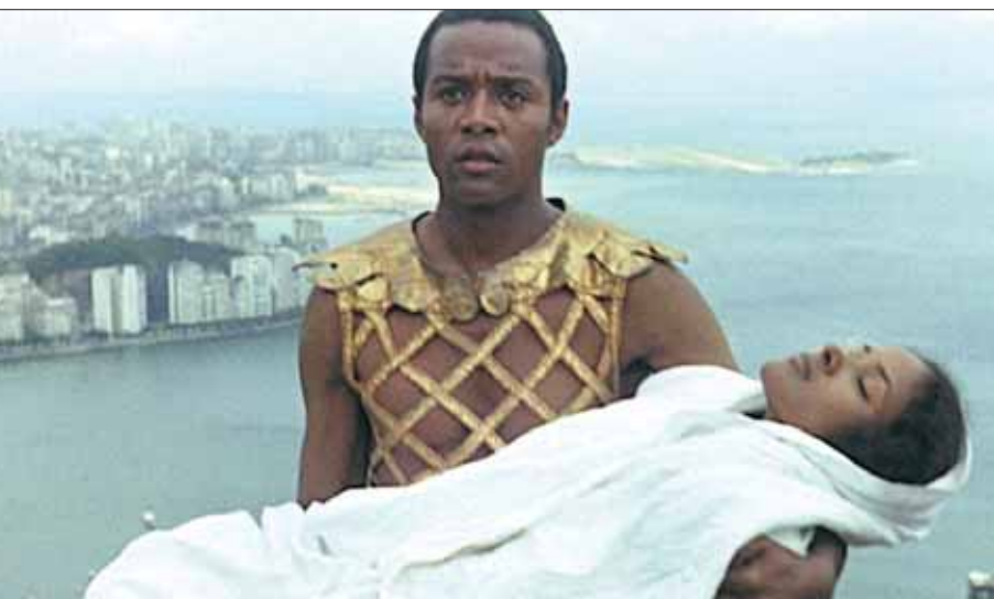
Black Orpheus «أورفيوس الأسود»

لكن ما يتجسد اليوم يضع الفيلم تحت مجهر مختلف. البرازيليون السود لا يكتفون لفقرهم ولا يوجد في الفيلم أي خط خلفي يشي بالوضع الاجتماعي. المواطنون الأوروبيون (برتغاليو الأصل) هم في غاية الطيبة وعلى قدر مختلف من الفهم والإدراك. ثم هناك تلك العين السباحية للتقاليد التي يريدها أن تبقى كذلك. بالتالي، الحب والغيرة والمشاعر العاطفية الأخرى تبقى سطحية. كذلك أداء ممثلين يجيدون الحركة أكثر من صدق التعابير.