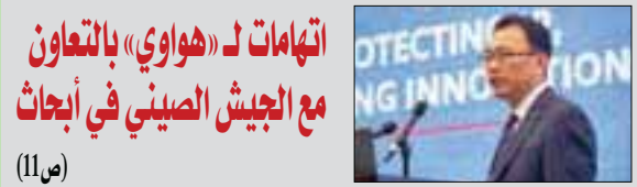
اتهامات لـ«هواوي» بالتعاون مع الجيش الصيني في أبحاث (11ص)