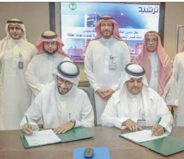
توقيع اتفاقية «ترشيد» السعودية مع مستشفى الملك فيصل التخصصي ومركز الأبحاث (الشرق الأوسط)

توفير الطاقة، وتشمل حلولاً للوصول إلى وفر في استهلاك الطاقة، كاستبدال أنظمة الإنارة بنوعية ذات كفاءة عالية موفرة للطاقة «اليد»، وتركيب نظام تحكم بالإضاءة، وتركيب أنظمة التحكم للأنظمة الميكانيكية والكهربائية للمباني، وإضافة تقنيات متقدمة لأنظمة التبريد الحالية لرفع كفاءتها في استهلاك الطاقة.