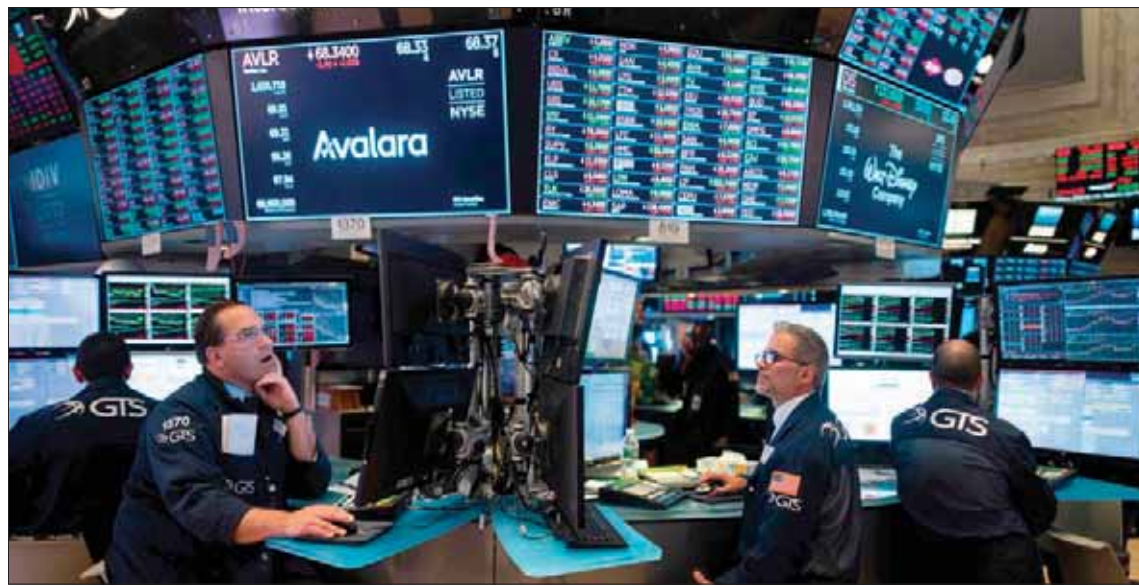
الاتفاق يعلق الجولة القادمة من فرض رسوم جمركية أمريكية على سلع صينية إضافية قيمتها 300 مليار دولار (أ.ب)

الفرقة السويسرية دون تغير يذكر عند 1,117 فرقة لليورو. وارتفع اليوان الصيني في المعاملات الخارجية 0,1 في المائة إلى 6,8802 يوان للدولار، مما ساعده على العودة صوب أعلى مستوى في ستة أسابيع عند 6,8370 يوان للدولار الذي لامسه الأسبوع الماضي. وزاد الجنيه الإسترليني 0,2 في المائة إلى 1,2714 دولار، بعد أن قال بوريس جونسون، الذي يتصدر سباق خلافة رئيسة الوزراء البريطانية تريزا ماي، إن فرص خروج بريطانيا من الاتحاد الأوروبي بلا اتفاق هي «واحد في المليون». وتراجعت أسعار الذهب أمس مع ارتفاع الدولار. وبحلول الساعة 06:54 بتوقيت غرينتش، انخفض الذهب في المعاملات الفورية 0,4 في المائة إلى 1402,09 دولار للأونصة (الأونصة) بعدما فقد أكثر من واحد في المائة في الجلسة السابقة. وتراجعت العقود الأمريكية الأجلة للذهب 0,6 في المائة إلى 1406,30 دولار للأونصة. ومن بين المعادن النفيسة الأخرى، انخفضت الفضة 0,4 في المائة إلى 15,18 دولار للأونصة، وتراجع البلاتين 0,4 في المائة إلى 811,13 دولار للأونصة. ونزل البلاتينوم 0,2 في المائة إلى 1519,10 دولار للأونصة.