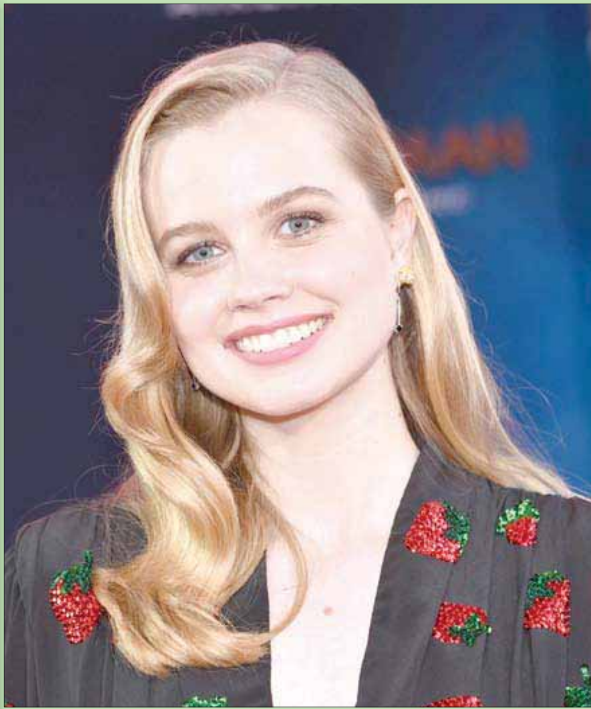
الممثلة الأسترالية أنجوري رايس حضرت إلى العرض الأول لفيلم «الرجل العنكبوت: بعيد عن الوطن» في هوليوود (أ.ف.ب)

إذن - ومع كثير من التقدير - يجب أن توجه السلطة الشرعية اليمنية لنفسها بعض النقد الصحي... وكل ابن آدم خطأ.