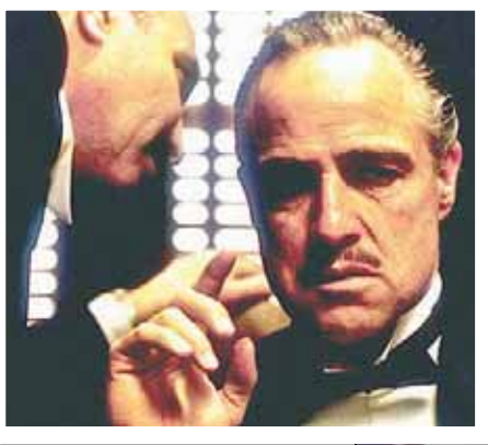
The Godfather «العرب» تصوير غوردون ويليس

ابتكار مواقفهم. لكن ما بلغت الانتباه هو أن المندروس صور 19 أسبوعاً من 72 أسبوع تصوير. الأميركي هاسكل وكسلر لذلك يقفز السؤال حول تصوير من الذي نتحدث فيه؟ المندروس أو وكسلر (كلاهما ذو أسلوب مختلف). بالنظر إلى الفيلم يتبين أن أندروس وضع الأساس والصيغة البصرية