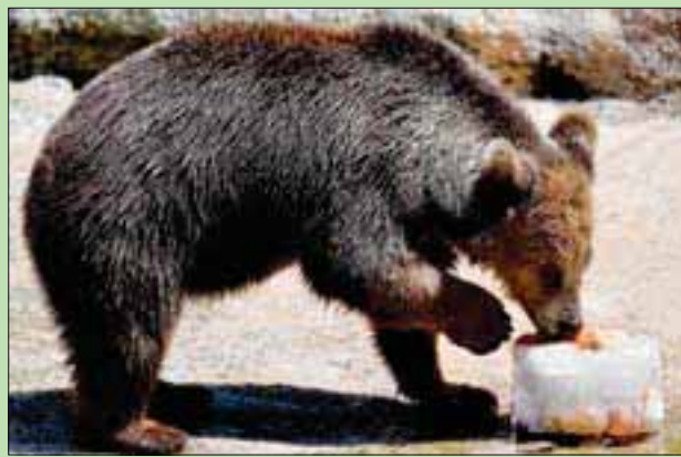
دب يتناول فاكهة ملثة في حديقة حيوان روما بعدما ارتفعت درجات الحرارة في العاصمة الإيطالية إلى 36 درجة مئوية

وندت الطبيب ميهو سوسيك، المسؤول عن إدارة الطوارئ في مدينة سيليت في كرواتيا، بعدم وعي البعض تجاه موجة الحر.