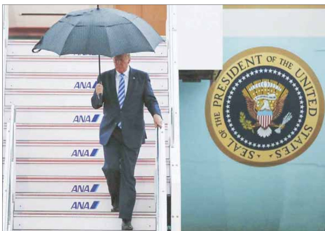
الرئيس الأميركي لدى وصوله إلى مطار أوساكا أمس لحضور قمة مجموعة العشرين

بينهما سيؤثر علينا، نتابع ونأمل حل الخلافات بأسلوب بناء». وكان أبي قال قبل مغادرته طوكيو إلى أوساكا أمس لتؤسس أعمال القمة إن هناك دولا في المجتمع الدولي نتحدث عن الصدام. اليابان تبحث عن التلاقي ونقاط التقاطع. أريد التأكيد على حرية التجارة والنمو الاقتصادي عبر الاختراع والمساهمة في قضايا. وسالتقي شي وترمب للتأكيد على أهمية نجاح قمة العشرين». لافتا إلى أنه سيلتقي بعد ختام أعمال القمة الرئيس فلاديمير بوتين للبحث عن سبل المحي شي عندما نتفق السلام» بين طوكيو وموسكو.