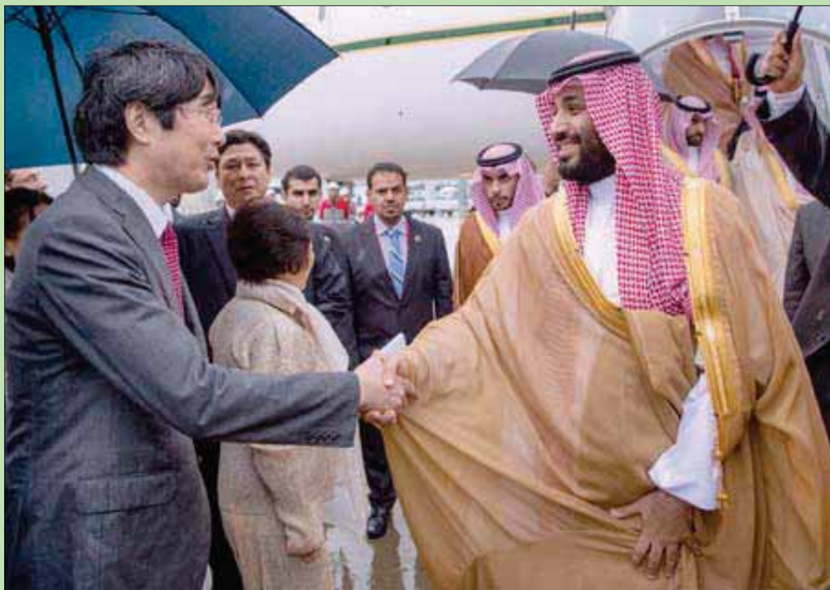
الأمير محمد بن سلمان لدى وصوله إلى مطار كانساي الدولي في أوساكا

مبيناً أن بلاده تستورد أكثر من مليون برميل من النفط من المملكة لتكوين هيكل أكبر مورد للنفط لليابان إلى جانب عدد كبير من المشروعات المشتركة والمشروعات الاستثمارية الجارية. ونوّه السفير الياباني بمساعي بلاده لتنويع علاقاتها مع المملكة، مشتمهاً بذلك على الحوارات السياسية الدورية والتعاون لمكافحة القرصنة قباله سواحل الصومال من الأمثلة، وقال: «نحن معكم على بناء علاقات أكثر مع السعودية كشركاء لا يستغني أحدهما عن الآخر».