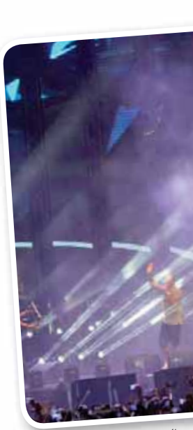
حفلة غنائية سابق للمطرب عمرو دياب في الساحل الشمالي بمصر

وأوضح السماحي أن «مصر كانت ولا تزال الأم التي تحضن النجوم العرب، ولم تكن لديها شوفينية، فلا تميز نجومها على غيرهم، وليست لديها عنصرية، ولا تنفر من أي فنان، إلا إذا كان غير موهوب ولا يملك الموهبة والجماهيرية التي تجذب الجمهور». وأضاف أن «مصر كانت ولا تزال الأم التي تحضن النجوم العرب، ولم تكن لديها شوفينية، فلا تميز نجومها على غيرهم، وليست لديها عنصرية، ولا تنفر من أي فنان، إلا إذا كان غير موهوب ولا يملك الموهبة والجماهيرية التي تجذب الجمهور».