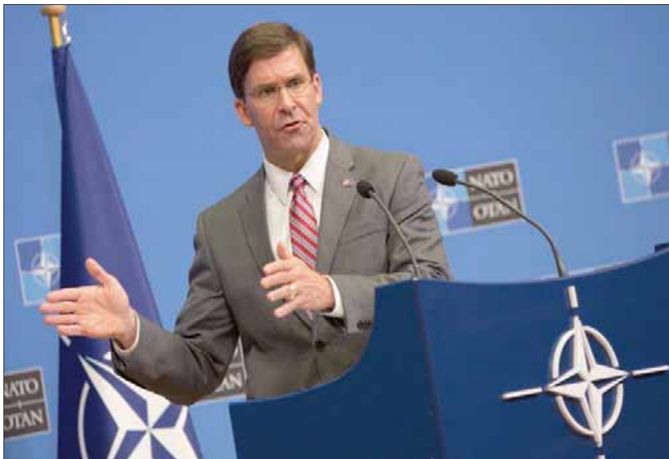
القائم بأعمال وزير الدفاع الأميركي مارك إسبر يتحدث في مؤتمر صحفي عقب اجتماع وزراء دفاع دول الحلف الأطلسي في بروكسل أمس

لندن: «الشرق الأوسط» ناشد القائم بأعمال وزير الدفاع الأميركي مارك إسبر الدول الأعضاء في حلف شمال الأطلسي أمس التتديد علنا بأفعال إيران المعادية والانضمام لجهود بلاده في تشديد الحقائق على إيران ودراسة المشاركة في خطة لا تزال قيد الإعداد لضمان سلامة الممرات المائية الاستراتيجية في الخليج. وناقش وزراء دفاع الحلف الأزمة أثناء اجتماعه خلف الأبواب المغلقة بمقر الحلف في بروكسل، حيث قال إسبر إن بلاده تسعى «للتدويل» قضية إيران، بعد أن دعا وزير الخارجية الأميركي الأسبق جيمس ماتيس لتشكيل «تحالف دولي» للتعامل مع إيران. وقال القائم بأعمال وزير الدفاع الأميركي مارك إسبر إنه حاض حلفاء بلاده على «النظر في (إصدار) بيانات تدين سلوك إيران السيئ وإيران أننا نحتاج إلى حرية الملاحة في مضيق هرمز».