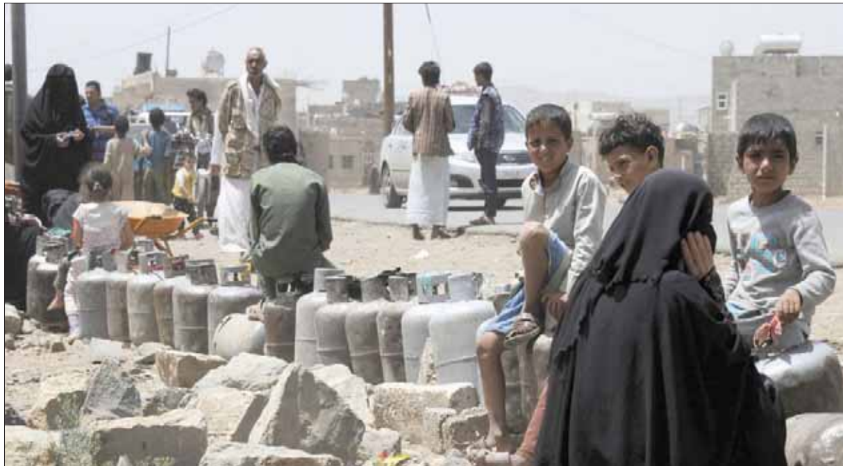
يمنيون في أحد طوابير شراء أسطوانات الغاز بمنطقة همدان التابعة لصنعاء (غيتي)

الانقلاب الحوثي. وقال التاجر، الذي رفض الكشف عن اسمه إن الأسواق المحلية تعج بالأسطوانات الغاز الرديئة مجهولة المصدر والصناعة. وأشار إلى بروز تجار جدد (ينتمون للجماعة الحوثية) ويعملون على استيراد وإغراق الأسواق المحلية بالآلاف الأسطوانات التي لا تحمل أي معلومات أو علامات تجارية.