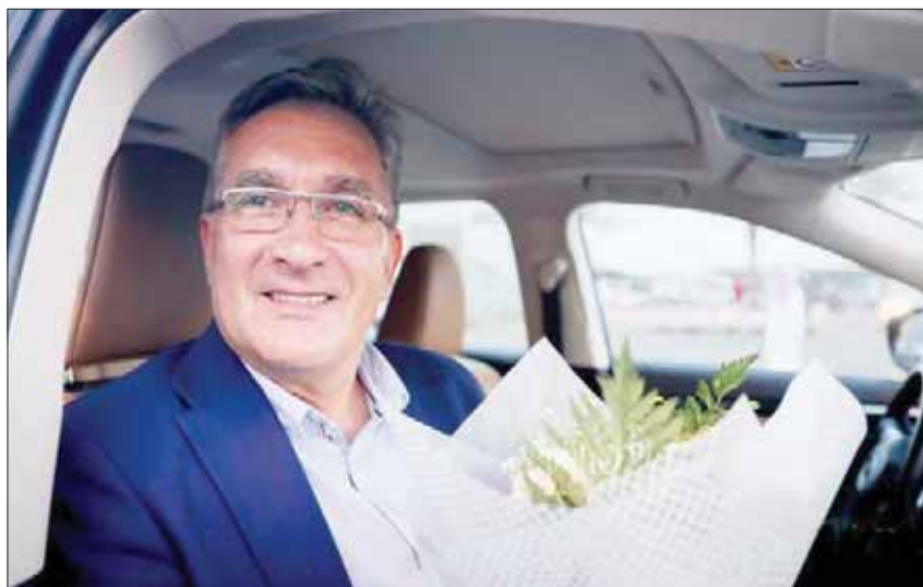
برانكو لدى وصوله إلى جدة