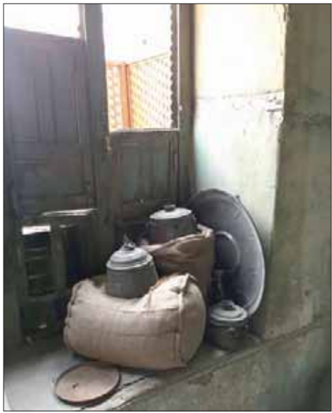
جزء من الأدوات القديمة التي تمثلها حلبة المسرحية

التجربة الأولى للمسرح التفاعلي من نوعها في مدينة جدة، حيث اشتهرت هذه المسارح في أميركا قديماً وانتقلت إلى أوروبا وكان لها تأثير كبير على الممثلين، لافتاً إلى أن هدفهم عبر المسرح التفاعلي أن يعيش الزوار ذات الحقيقة الزمنية التي تحكيها أحداث المشاهد، حيث ينقلهم من الحاضر إلى الماضي عن طريق سرد قصة مباشرة أمام الزائر، تتيح له أن يكون أقرب من الشخصيات تساعده في رسم صورة حقيقية لمجتمع لم يشاهده بعينه وإنما استطاع أن يرسم كامل ملامحه عن طريق الأحداث.