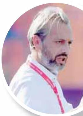
ديسابر مدرب أوغندا واتق من تأهل فريقه (أ.ب.أ)

الثانية وبنفس النتيجة (بعد الافتتاحية أمام أوغندا 2 - صفر) لكن لا يزال هناك أمل في فرصة التأهل ضمن أفضل منتخبات: تحلّق المركز الثالث». وأضاف: «لعينا بشكل جيد لكننا خسرننا، وهذا شيء مؤلم خصوصاً بالنسبة إلى اللاعبين. لدى مشاعر سيئة من أجلهم لأنهم عانوا كثيراً لكن كل هذا ضاع هباءً. تتبقى أمامنا مباراة زيمبابوي ونتمنى احتلال المركز الثالث في المجموعة. سنقاتل حتى اللحظة الأخيرة». وفي المباراة الأخرى بالمجموعة الأولى حرم منتخب زيمبابوي نظيره أوغندي من حسم تأهله إلى الدور ثمن النهائي بعد إجباره على التعادل 1 - 1. وكان المنتخب أوغندي بحاجة إلى الفوز لضمان تجاوز دور المجموعات للمرة الأولى منذ عام 1978، وذلك بعد انتصاره الأول على الكونغو الديمقراطية.