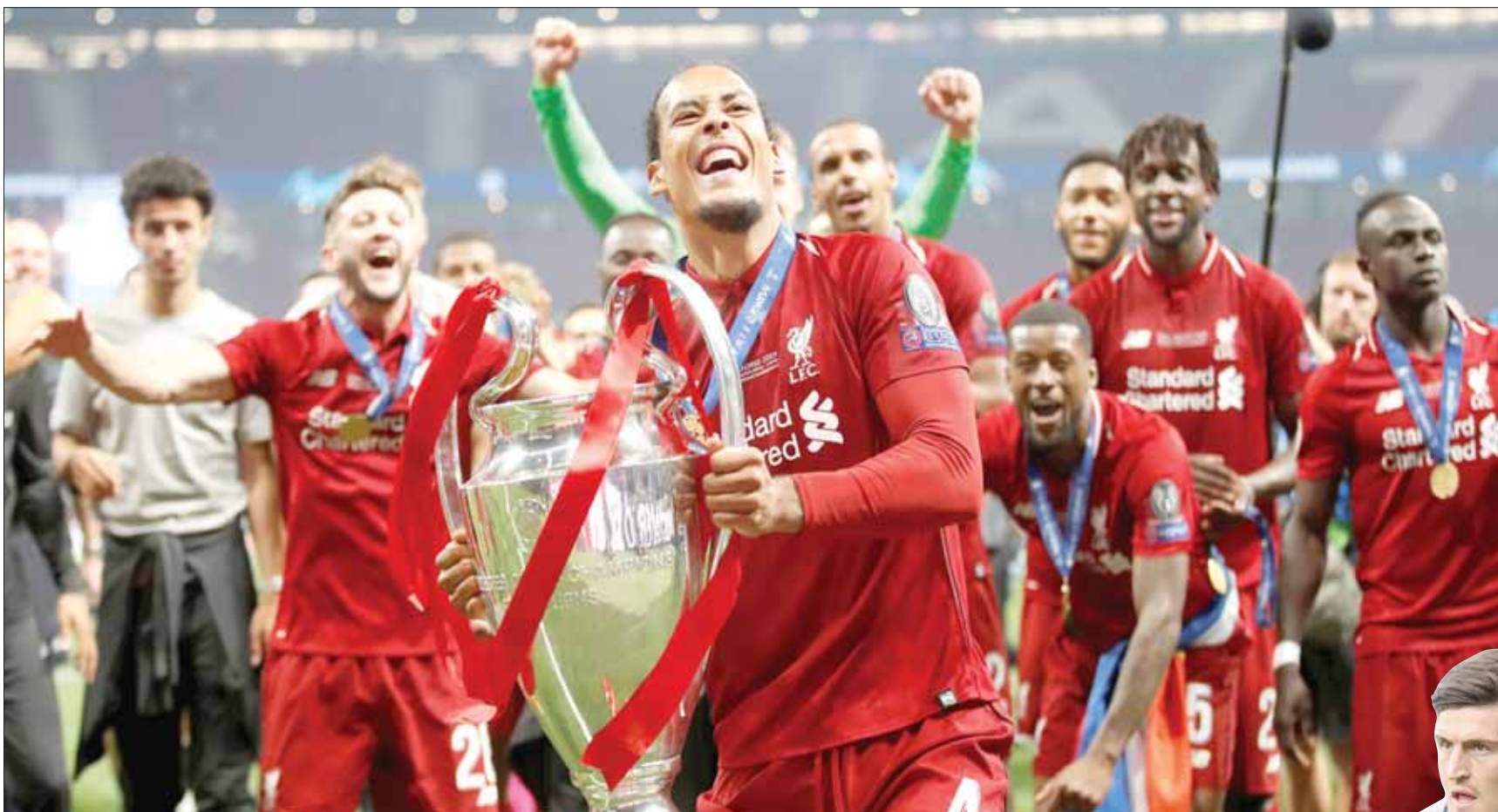
فان دايك لعب دوراً بارزاً في فوز ليفربول بدوري الأبطال بعد أن أصبح أعلى مدافع في العالم

وشخصية غوارديولا وكلوب في الوقت الحالي - لكن جميع التوقعات تشير بالفعل إلى أن المنافسة على لقب الدوري الإنجليزي الممتاز خلال الموسم المقبل ستقتصر على مانشستر سيتي وليفربول. لكن على الأقل يجب أن تكون المنافسة شرسة للغاية وحتى الرمق الأخير كما كان عليه الوضع الموسم الماضي. ولم يقتصر الأمر على إنهاء الصراع بفارق نقطة واحدة فقط لصالح مانشستر سيتي، لكن الموسم انتهى بفوز ليفربول أيضا بلقب دوري أبطال أوروبا، وهو الأمر الذي جعل جمهور كل ناد يحسد النادي الآخر على الإنجاز الذي حققه، حيث كان جمهور ليفربول يفضل الفوز بلقب الدوري الإنجليزي الممتاز في الموسم الماضي، بينما كان جمهور ليفربول يفضل الفوز بلقب الدوري الإنجليزي الممتاز في الموسم الماضي. ولم يقتصر الأمر على إنهاء الصراع بفارق نقطة واحدة فقط لصالح مانشستر سيتي، لكن الموسم انتهى بفوز ليفربول أيضا بلقب دوري أبطال أوروبا، وهو الأمر الذي جعل جمهور كل ناد يحسد النادي الآخر على الإنجاز الذي حققه، حيث كان جمهور ليفربول يفضل الفوز بلقب الدوري الإنجليزي الممتاز في الموسم الماضي، بينما كان جمهور ليفربول يفضل الفوز بلقب الدوري الإنجليزي الممتاز في الموسم الماضي.