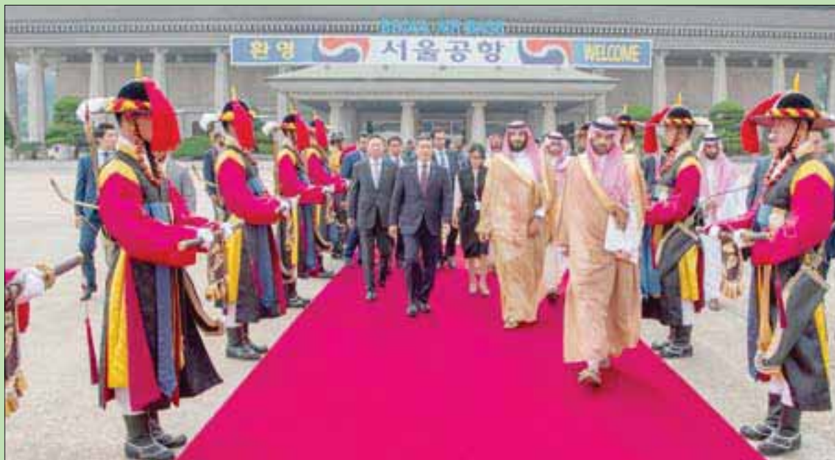
ولي العهد السعودي مغادراً من مطار القاعدة الجوية بالعاصمة سيول ووزير الدفاع الكوري الجنوبي جونج كيونغ دو في وداعه (واس)

وأشار السفير الياباني في تصريحاً إعلامياً إلى أن علاقات الرياض وطوكيو تطورت في القرن الماضي بشكل أساسي في جانب تجارة النفط والعمليات التجارية،