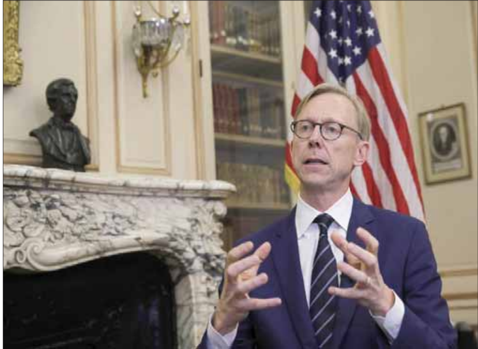
برايان هوك المبعوث الأميركي الخاص بإيران في السفارة الأميركية بباريس أمس

ولا سيما من قبل الدول الأوروبية. إذا توافر هامش المناورة للرئيس ماكرون الذي اتصل به روحاني قبل سفره إلى اليابان، فإنه قد يكون قادراً على طرح بعض الأفكار التي من شأنها ليس إيجاد حلول لهذه المشكلة الشائكة حيث إن الأطراف الأوروبية واقعة بين المطرقة الأميركية والسندان الإيراني، بل «تهدة الوضع»، ووقف السير نحو مزيد من التصعيد، وفق ما قالته مصادر أوروبية لـ«الشرق الأوسط»، على أن تكون هذه المرحلة الأولى التي ستسحقها مراحل أخرى. ونقلت «رويترز» من اليابان أن ماكرون، خلال الرحلة التي أقلتته بالطيران من طوكيو إلى مدينة كيوتو اليابانية، أعلن أنه «ستطرح إلى إقناع ترمب بأن استئناف العملية التفاوضية يصب في مصلحته، وبالتراجع عن بعض العقوبات إعطاء فرصة للتفاوض». وأضاف ماكرون أن قبوله اقتراحه يعني «لنأخذنا سطر أنفسنا بضعة أشهر لنحدد مسار التفاوض». وإذا صح الخبر الذي نقل، أمس، من فيينا، وقوامه أن تهديد إيران بتخطي سقف 3000 كلغ من اليورانيوم ضعيف التخصص، وهو ما يمنح إيهاها الاتفاق النووي، لم يبدأ العمل بتنفيذه، فهذا يمكن فهمه على أنه «إشارة تهدئة»، وورقة تفرها طهران للرئيس ماكرون، كبادرة «حسن نية»، وتعتبر المصدر الأوروبي أن الأخير يريد من طهران أن «تجهد» أو تؤخر تنفيذ تهديداتها بالانتقال بالتخصيب إلى ما فوق نسبة 3,67% في المائة وإعادة العمل بمصنع «أراك» للمياه الثقيلة وهو الإنذار الذي سبق لها أن وجهته إلى الأوروبيين الذين تتهمهم بعدم تنفيذ الوعود التي أعطاها على إيران.