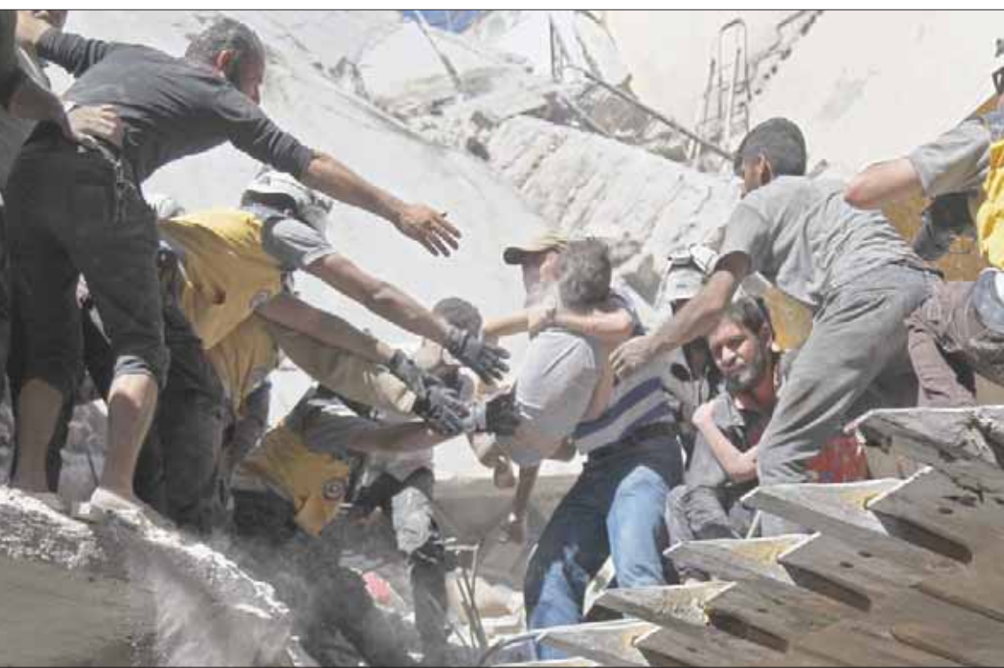
متطوعو الخوذ البيضاء ومدنيون يحاولون إنقاذ طفل من بين الركام بعد غارات على أريحا في إدلب أمس

الاحتجاز، فالسواد الأعظم فيه هم من النساء والأطفال، بما في ذلك الأطفال حديثي الولادة. ورُحبت بالأبناء التي تفيد بإعادة الأطفال من جنسيات أجنبية إلى بلادهم، غير أن الموقف بالنسبة لألاف الأطفال الآخرين الباقين في مخيم الهول بشمال شرقي سوريا لا يزال مخزياً. كما نطالبت بأن يُلغى الناس في المخيم معلومات بشأن أماكن وظروف معيشة أفراد أسرهم، مع تذكير أطراف النزاع الأوروبية عن «عزم الاتحاد الأوروبي» على محاسبة المسؤولين عن انتهاك القانون الدولي الإنساني.