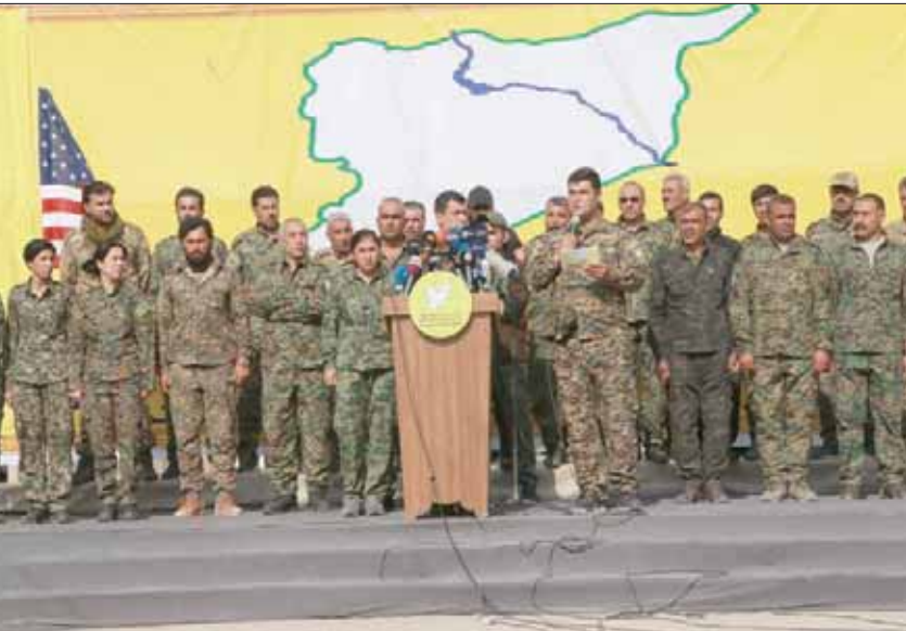
عناصر «سوريا الديمقراطية» في إعلان النصر على «داعش» بحقل «عمر» النفطي شرق سوريا في مارس الماضي (الشرق الأوسط)

يُذكر أن المجموعة المصغرة لممثلي دول التحالف الدولي عقدت اجتماعاً بالعاصمة الفرنسية باريس يوم الثلاثاء الماضي، وتعدت بتقديم 20 مليار دولار من المساعدات الإنسانية لإعادة الاستقرار لدعم الشعبين العراقي والسوري، وتدريب وجهيز 210 ألف من أفراد وقوات الأمن والشرطة في كلتا الدولتين.