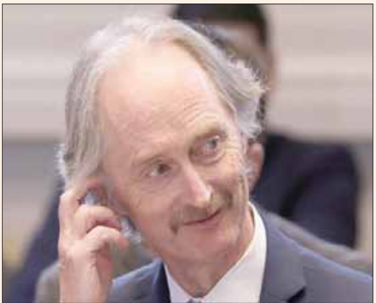
غير بيدرسن مبعوث الأمم المتحدة إلى سوريا في الأستانة في أبريل الماضي

سوريا. وعبر عن اعتقاده أيضاً أن «إحراز تقدم في شأن المحتجزين والمختطفين والمفقودين - إذا حصل بطريقة ذات مغزى وعلى نطاق واسع - يمكن أن يكون مؤثراً»، وشدداً على إعطاء الأولوية للاطلاق الأحادي للنساء والأطفال والمرضى والمسنين. وأكد أنه سيواصل مع نائبة المبعوث الخاص، حولة مطر، «الإلحاح على روسيا وتركيا وإيران (...) بغية ممارسة الجهود اللازمة لتحقيق مزيد من النتائج الإيجابية في هذا الملف».