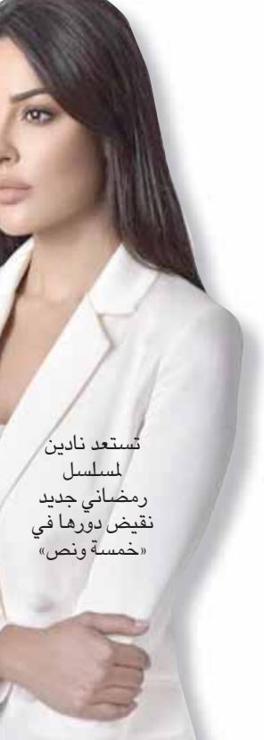
تستعد نادين نسيب نجيم لبطولتها في مسلسل «خمسة ونص»

وعما أضافت إليها مشاركتها كبار الممثلين في لبنان، كرلى حمادة ورفيق علي أحمد، في مسلسل «خمسة ونص» تقول: «برأيي فإن بدا واحدة لا تستطيع أن تصدق، وليس هناك من نجم في إمكانه أن يحمل عملاً يكمله على كتفيه. فكلمنا وجد الممثل في إطار عظيم، لمع نجمه أكثر. وهو ما تم تطبيقه في «خمسة ونص»، فقد وجد بين فريقه تكامل ملحوظ لمسه المشاهد، فالشراكة جميلة في أي