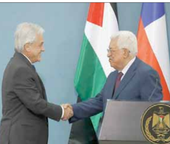
الرئيس محمود عباس مستقبلاً رئيس تشيلي سباستيان باينيرا في رام الله أمس

وقد أظهر الاستطلاع، الذي نشرته «القناة 12» العبرية للتلغرافيون الإسرائيلي، أنه، في حال أجريت الانتخابات للكنيست (البرلمان الإسرائيلي)، اليوم، فسيحصل معسكر الوسط واليسار على أغلبية 61 مقعداً برلمانياً، ويذهب لليكود وتنحياهو إلى المعارضة. ويظهر الاستطلاع خسارة الحزبين الأكبرين لليكود و«كحول لفان»، على ثلاثة مقاعد لكل منهما، والاستمرار في التساوي بحجم قوة كل منهما: 32 مقعداً. لكن ما يرجح الكفة، هو حصول يهود باراك على 6 مقاعد، جاءت بمعظمها من أصوات اليمين. ويظهر الاستطلاع أن العرب، بعد قرارهم إعادة تشكيل «القائمة المشتركة» سيستعيدون قسماً