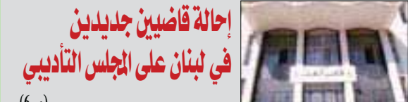
إحالة قاضيين جديدين في لبنان على المجلس التأديبي (6ص)

نماذج هذه الأحياء، أن زيادة مستوى السكر في الدم يؤدي إلى استجابات داخل جزر خلايا (بيتا) تصدر من خلايا قائدة معينة، وعندما ازلنا بشكل انتقائي تلك الخلايا القادة، رصدنا ارتباكاً في مستوى التنسيق بين الخلايا». وقال العلماء الذين نشروا نتائجهم في مجلة «نيتشر - ميتابوليزم» أنهم يسعون الآن لفهم أهمية الخلايا القادة واحتمالات تعرضها للضرر الذي قد يؤدي إلى الإصابة بالسكري.