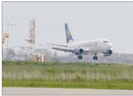
طائرة تجارية تستعد للهبوط في مطار اللد

نفي مسؤول روسي أمس الخميس، أن تكون بلاده هي المسؤولة عن تشويش نظام تحديد المواقع (جي بي إس) في مطار اللد، والذي أدى إلى تشويش حركة الطائرات في إسرائيل وعدة دول في البحر المتوسط مثل قبرص واليونان وغيرها. وكانت السلطات الإسرائيلية قد أعلنت عن حالة طوارئ بدرجة منخفضة، لفحص أسباب التشويش على الطائرات التي تهبط أو تطلع من مطار اللد. وقالت إن الطيارين الذين يهبطون أو يقلعون من مطار اللد يتحدثون للاسبوع الثالث للفلسطينيين اتهموا بالتخابر مع إسرائيل وتعرضوا للتعذيب في سجون السلطة الفلسطينية. وحسب القناة العبرية السابعة، فإن التحويلات الزامية، وستدفع 52 فلسطينياً بعد قرار من المحكمة العليا والمركزية باحقيق حصولهم على التحويلات، وتجربهم هذه الخطوة على صحة الموقف الرافض لأي منس بالأموال الفلسطينية، وتشكل ضربة أخرى للسلطة، وتعمق الأزمة الحاصلة أصلاً.