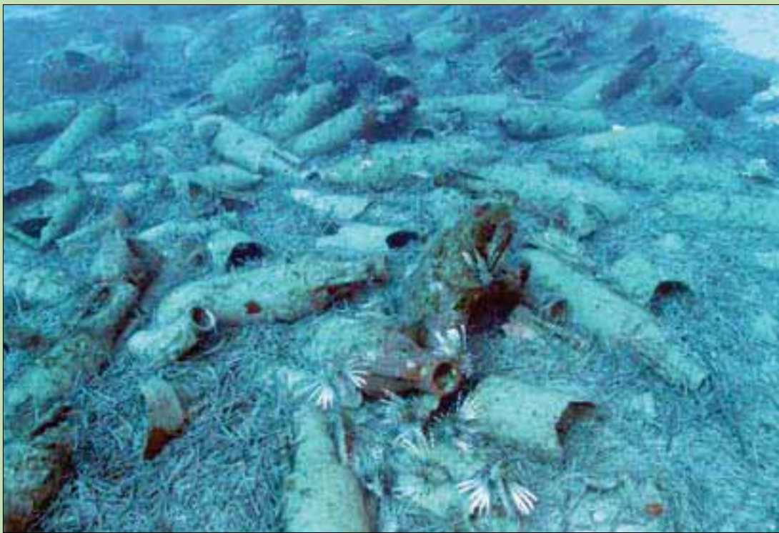
أثينا - لندن: «الشرق الأوسط»

في اكتشاف يعتقد أنه الأول من نوعه، عثر باحثون في قبرص على حطام سفينة تعود للعصر الروماني قبالة سواحل منتجع شهير حول الجزيرة الواقعة في شرق البحر المتوسط. واكتشف غواصون حطام السفينة وشحنتها قبالة منطقة بروتاراس الشرقية، ويقوم خبراء آثار بفحصها حالياً. وكانت السفينة تحمل جراباً يرجح أنها من سوريا وقيليقيا، وهي منطقة ساحلية بجنوب تركيا اليوم، حسب رويترز. وقالت هيئة الآثار القبرصية في بيان أمس الخميس: «هذا أول حطام كامل لسفينة رومانية يعثر عليه قبالة قبرص، ويتوقع أن تسلط دراسته الضوء من جديد على مستوى اتساع ونطاق التجارة بين قبرص وباقي الأقاليم الرومانية بشرق المتوسط».