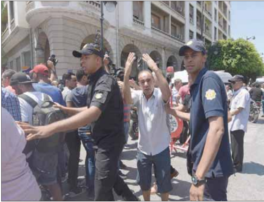
إجراءات أمنية قرب موقع التفجير الانتحاري بوسط العاصمة تونس أمس

تونس، المتجني السعيداني أبوظبي، «الشرق الأوسط» تعرضت العاصمة التونسية، أمس، إلى هجومي انتحاريين متزامنين نفذتهما عناصر إرهابية، وكان الهجوم الأول قد استهدف دورية أمنية بمدخل نهج (شارع) شارل ديغول، الذي يقع على بعد أمتار من مقر السفارة الفرنسية بتونس، وقد أسفر هذا الهجوم عن وفاة وحيدة نتيجة الهجوم على عناصر الأمن، علاوة على أربع إصابات أخرى بمقاومة الخطورة، من بينها اثنان من المدنيين. في الوقت ذاته، تعرضت منطقة الأمن بالقرجاني، وهي تحتضن مقر مكافحة الإرهاب، إلى هجوم انتحاري ثان، كان قد استهدف العناصر الأمنية التي هبت إلى مكان التفجير الإرهابي وسط العاصمة التونسية، وأسفر هذا الهجوم عن ذلك عن إصابة أربعة عناصر أمنية بجراح متفاوتة الخطورة، لتصبح حصيلة العليتين الإرهابيتين تسع إصابات بجراح ومقتل عنصر امني واحد. وعلى الفور، هربت تعزيزات أمنية كبرى إلى مكان الانفجار وسط العاصمة التونسية؛ والداخلية التونسية عن محدودية