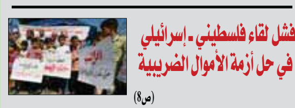
فشل لقاء فلسطيني - إسرائيلي في حل أزمة الأموال الضريبية (8ص)