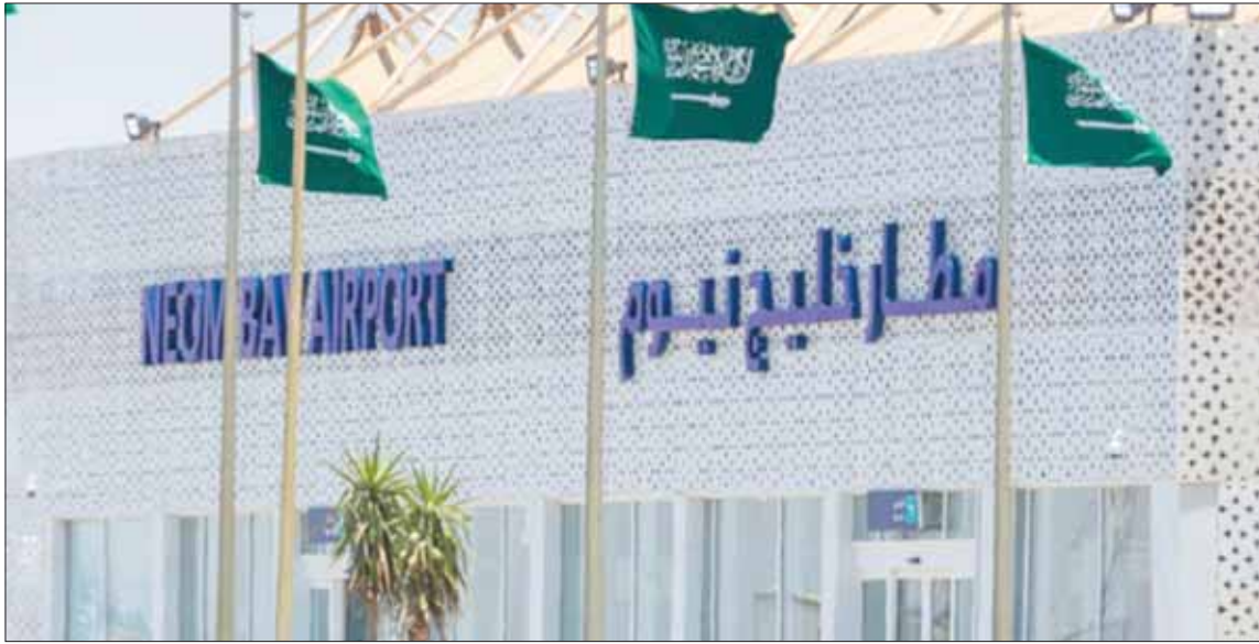
مطار نيوم يبدأ استقبال رحلاته الأحد المقبل

لوجيستي لربط القارات الثلاث. وتعد مدينة نيوم وجهة عالمية فريدة تسعى السعودية من خلالها لبناء مستقبل جديد قائم على الإبداع، بالإضافة إلى ذلك تحظى مدينة نيوم التي تطل على البحر الأحمر، بالكثير من الثقافات والحضارات التاريخية القديمة التي سكنتها قبل آلاف السنين منها «مدائن شيب» في «البدع» في منطقة تبوك والتي تضم منازل ومعابد منحوتة في الجبال والصخور، بالإضافة إلى ذلك وجود منطقة عيون موسى وهي 12 عيناً لمياه كبريتية في منطقة مقناة التي تطل على خليج العقبة، وعدة شواطئ تحظى ببقايا المياه وجمال الرمال وتنوع التضاريس.