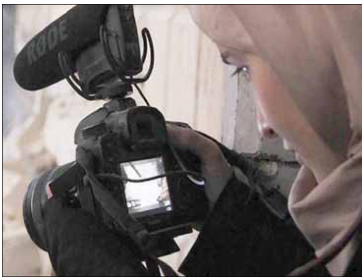
For Sama من الفيلم السوري «لأجل سما»

المخرجين الأميركية» في هوليبود عدم قبول أفلام تنتجها الشركات التي تبث مباشرة إلى المنازل وذلك في إيعاز واضح ولاية ماساتشوستس الأميركية). الفيلم الأسواق التجارية أولاً. الخطوة اعتبرت جريئة لم تقدم عليها أكاديمية الأوسكار بعد.