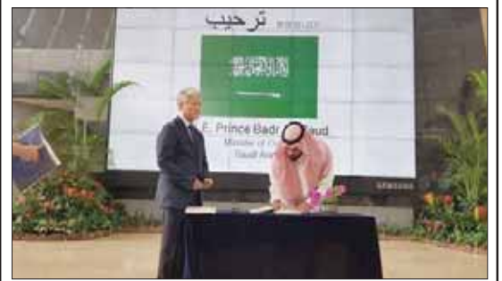
سيول، الشرق الأوسط، ناقش الأمير بدر بن عبد

الملك بن فرحان وزير الثقافة السعودي، خلال زيارته المتحف الوطني الكوري، سبل التعاون المشترك بين المتحف الكوري ووزارة الثقافة التي تولي اهتماماً كبيراً بالتعاون الثقافي مع كوريا الجنوبية. وأكد الأمير بدر أن السعودية وكوريا الجنوبية تتشركان قديمًا وتعززان التعاون ونشر الحوار في العالم، ما فتح آفاقاً