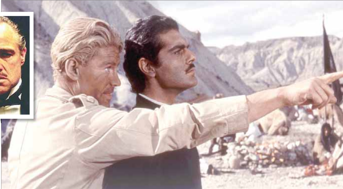
Lawrence of Arabia «لورنس العرب» عمر الشريف وبيتر أوتول

10 «الصلة الفرنسية» The French Connection تصوير: أوون رويزمان (1971) الفيلم نموذجي للتصوير في شتاء مدينة مثل نيويورك ورويزمان أراد النقاط التفاصيل الواقعة طوال الوقت. تحديات كثيرة تقع في هذا المضمار تتجلى في المشهد الذي يقع في محطة قطار تحت الأرض بين فرناندو راي وجين هاكمن. هنا فكر رويزمان بطبيعة الحال بالاستعانة بإضاءة إضافية، لكنه قرر في النهاية الاكتفاء بالمتوفر. النتيجة مبهرة لفيلم من هذا النوع.