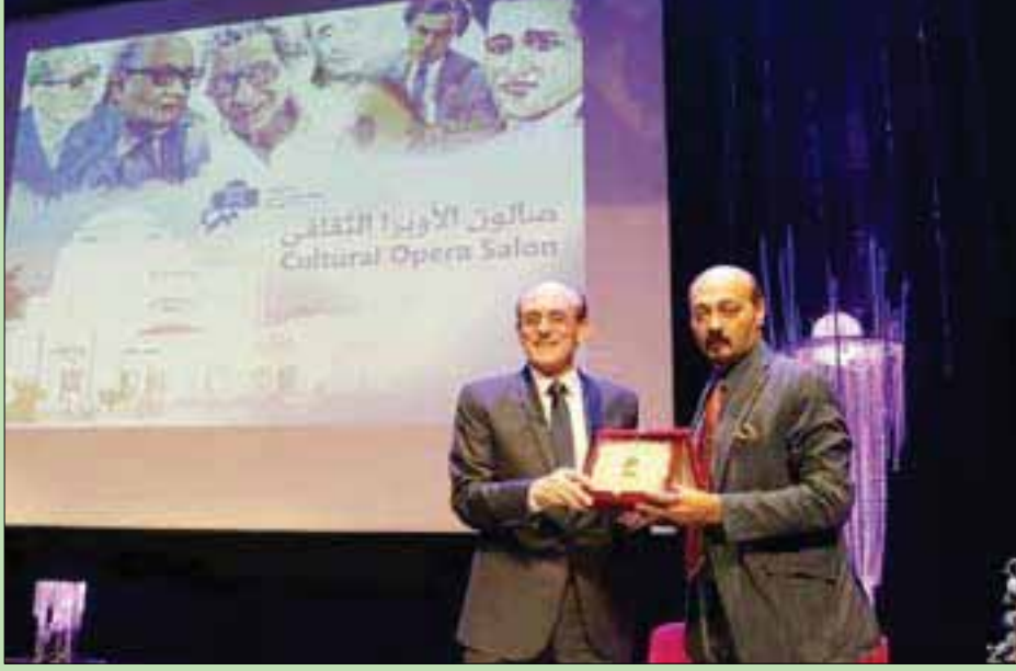
تكريم الفنان محمد صبحي بدار الأوبرا المصرية (دار الأوبرا المصرية)

وبدأت علاقة صبحي بال تلفزيون عبر مسلسل «فرصة العمر» في منتصف السبعينات، ثم ابتعد عن التلفزيون فترة طويلة قبل أن يعود في عام 1984 من خلال مسلسلة الشهر «رحلة المليون»، بجزأيه الأول والثاني، والذي حقق نجاحاً كبيراً أثناء عرضه. وفي بداية التسعينات قدم مسلسل «ستيل»، وفي عام 1994 بدأ صبحي في تقديم شخصية «نويس» من خلال مسلسل حمل اسم «يوميات نويس» في ثمانية أجزاء.