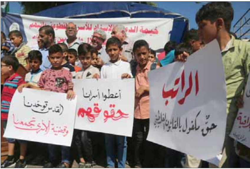
أطفال يشاركون في مظاهرة مطلبية

وقبول المسؤولين الفلسطينيين إن الموافقة على خصم أي قرش سيعني الموافقة على الموقف الإسرائيلي، الذي يدين «الشهداء والأسرى»، وسيشجع إسرائيل على اتخاذ خطوات أخرى عبر المش بالأموال الفلسطينية لأي سبب. وأمن فقط أصدر مكتب التنفيذ القضائي في إسرائيل، قراراً لوزارة المالية بخصم 14 مليون شيكل من أموال الضرائب الخاصة بالسلطة، كتعويض لفلسطينيين اتهموا بالتخابر مع إسرائيل وتعرضوا للتعذيب في سجون السلطة الفلسطينية. وحسب القناة العبرية السابعة، فإن التحويلات الزامية، وستدفع 52 فلسطينياً بعد قرار من المحكمة العليا والمركزية باحقيق حصولهم على التحويلات، وتجربهم هذه الخطوة على صحة الموقف الرافض لأي منس بالأموال الفلسطينية، وتشكل ضربة أخرى للسلطة، وتعمق الأزمة الحاصلة أصلاً.