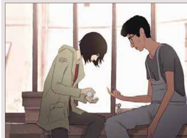
I Lost my Body

خرج هذا الفيلم قبل أيام قليلة بالجائزة الأولى من مهرجان أنيسي سينما الأنيميشن. وكان شوهد في «أسبوع النقاد» خلال مهرجان «كان» السينمائي الذي مضى. إنتاج فرنسي من مخرج لم يسبق له أن حقق فيلم رسوم من قبل (ولا تشيهر خلفيته