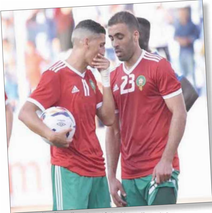
عبد الرزاق حمد الله في مباراة سابقة لمنتخب المغرب (الشرق الأوسط)

وتسافر بعثة المغرب إلى مصر في 18 يونيو على متن طائرة خاصة. ويلعب منتخب المغرب في المجموعة الرابعة القوية إلى جانب ناميبيا وساحل العاج وجنوب أفريقيا.