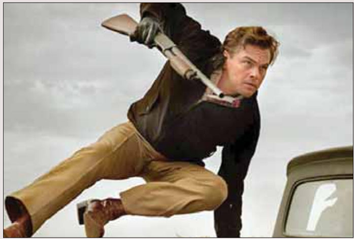
ليوناردو ديكابريو في لقطة من الفيلم

هناك أكثر من طريقة للحديث عن هوليوود. طريقة وريت الدريش في «السين الكبير» (1955)، حيث يصير الممثل معلق بحصوله على الأوسكار من عدمه، وطريقة روبر التمن في «اللاعب» حيث يوجه الفيلم سهامه النقدية إلى