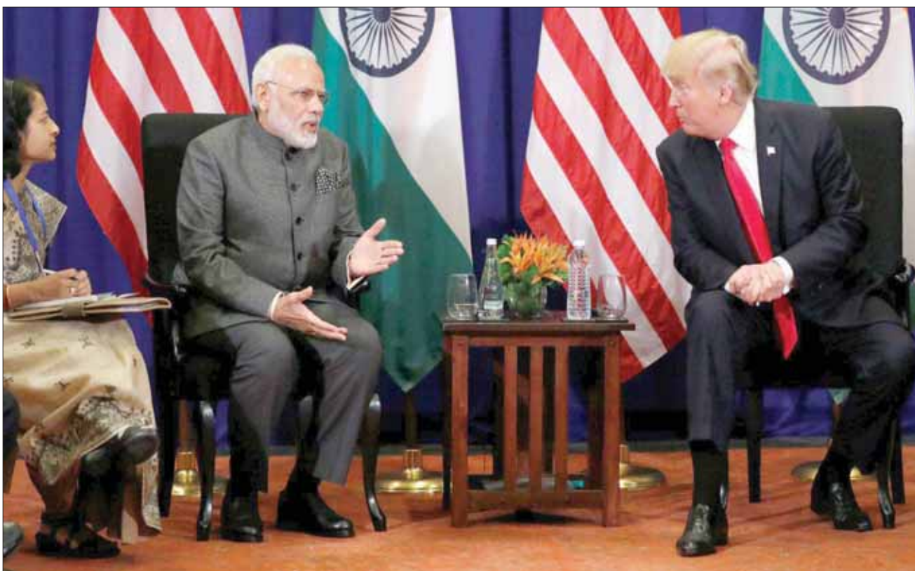
لم ينجح لقاء ترمب ومودي صيف العام الماضي في تلافي الصدام التجاري بين بلديهما

وهناك حالة احتكاك أخرى طويلة الأمد جارية بين البلدين بشأن العقاقير النوعية (الكافئة). ولا تليي الهند سوى 40 في المائة من الطلب الأميركي في هذا المجال. ورفضت الولايات المتحدة قواعد إصدار الشهادات الهندية التي تقبلها مصدرين آخرون مثل الاتحاد الأوروبي، واعتمدت الهند تغيير قواعد التجارة الإلكترونية