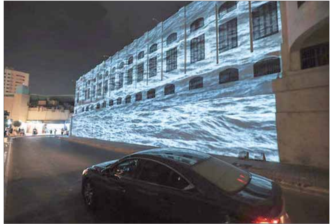
لقطتان من زاويتين مختلفتين لبناية «باب البنط» في جدة التاريخية

العلاقات المتعددة الأوجه في مشهد فني واحد، بحيث يتم عرضه على الجدران الخارجية للمبنى نفسه والتي يعكسها العمل بواسطة «البروجكشن»، ليتيح حرية التعامل مع جميع طبقات المجتمع بخلفياتهم الثقافية والعلمية المختلفة. فيما يختم العمل قصته المصورة بقصيدة للشاعر أبي نواس عندما أدى فريضة الحج قبل مئات السنين.