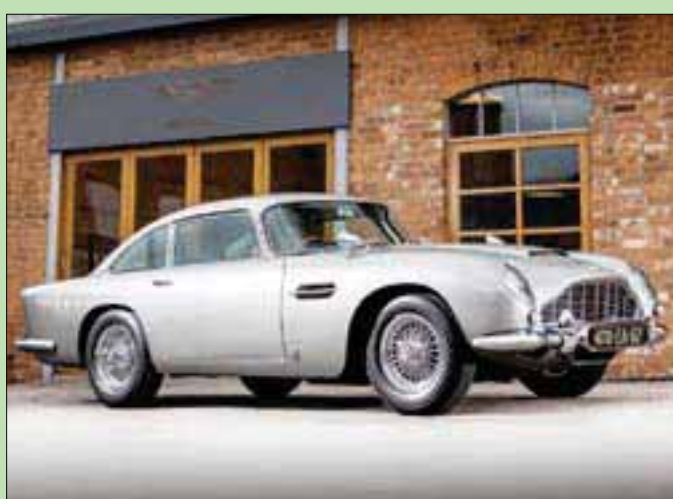
«أستون مارتن دي بي 5»

عندما يبدأ عصافور من الذكور أو الإناث ذات الحواف بيضاء اللون في الغناء، يضيّف شريكه في وقت معين، ليكوّن «دويتو» متناغماً بشكل دقيق جداً، يحاول الباحثون معرفة أسرارها. وباستخدام أجهزة إرسال متقلبة لتسجيل الإشارات العصبية والصوتية في وقت واحد، وضع باحثون ألماني من معهد «ماكس بلانك» في علم الطيور، أيديهم على السر، الذي يكمن في أن نشاط الخلايا العصبية في عقل الطائر الذي بدأ بالغناء يتغير ويتزامن مع شريكه، عندما يبدأ الثاني في الغناء، ليعمل دماغا كلاً للطائرين بشكل أساسي، مما يؤدي إلى الثنائي المثالي. وتعيش الطيور ذات الحواف البيضاء (Plocepasser mahali) معاً في مجموعات صغيرة على الأشجار، جنوب وشرق أفريقيا، وهي من أنواع الطيور القليلة التي تغني بشكل ثنائي، وهو أمر كان من الصعب أن يحدث في المختبر، ولذلك أجرى الفريق البحثي دراسته في البيئة الطبيعية للطيور، ليكشف عن السر الذي حذر العلماء، في دراسة نشرت