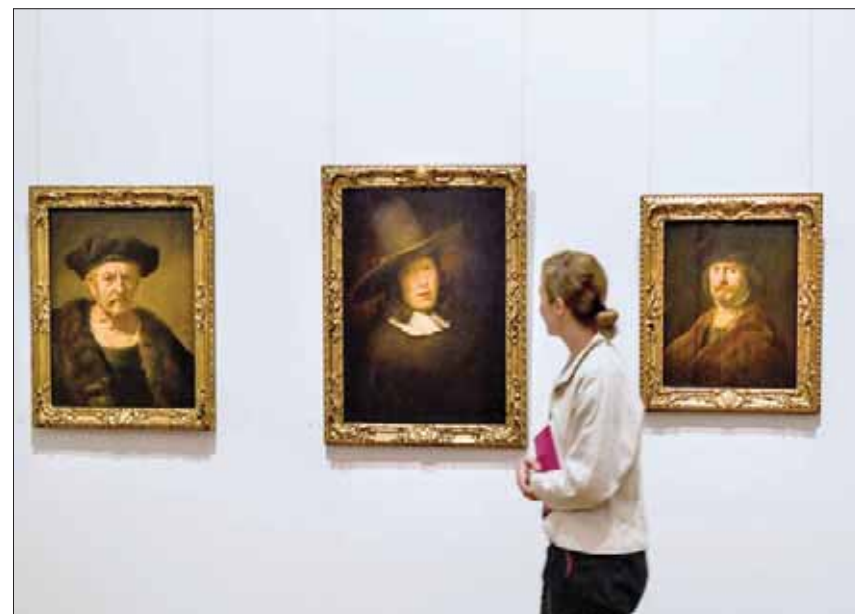
من معرض «علامة رمبرانت» في درسدن

رسماً لساسكيا تُقدم معاً للمرة الأولى، ومنها لوحة رسمها لها بمناسبة خطبتها، و لوحة زيتية تبدو فيها ضاحكة. في القسم الثالث يستكشف المعرض رمبرانت التلميذ والاستاذ بعنوان «رمبرانت يتعلم... ورمبرانت يعلم» حيث يتعرض لعلاقة رمبرانت مع غيره من الفنانين الذين عمل معهم، سواء كتلميذ أو والظلال في لوحات رمبرانت.