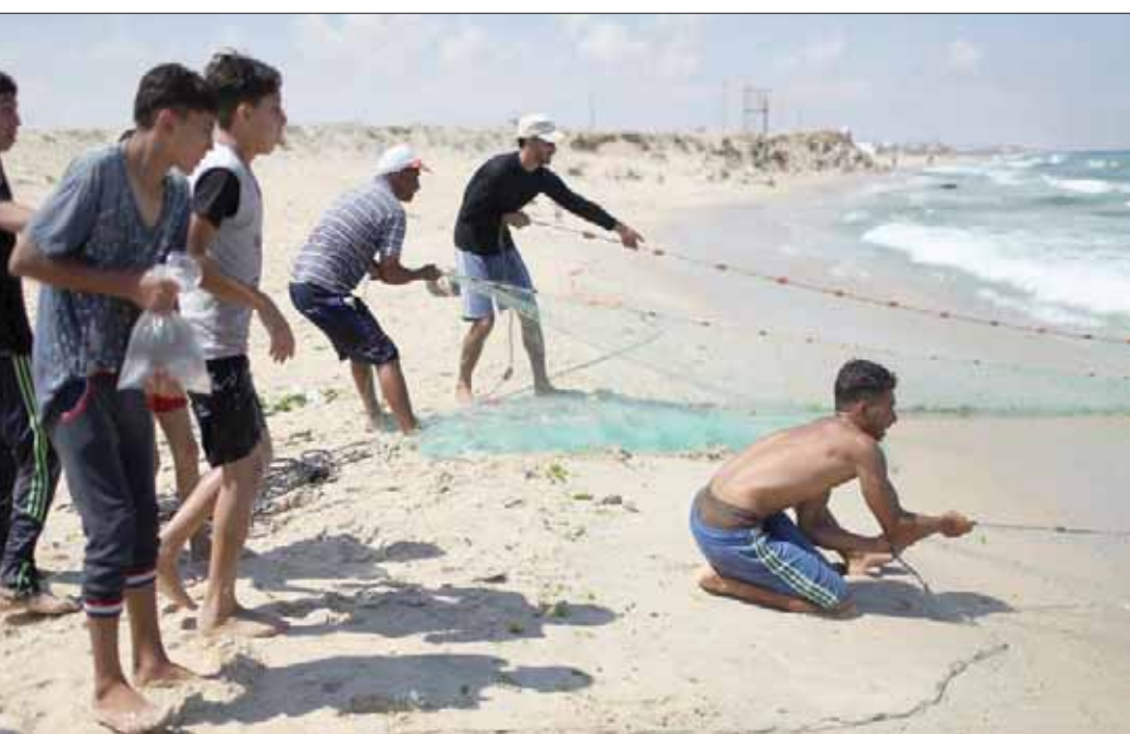
صيادون في غزة بعدما منعهم إسرائيل من استخدام مراكبهم

استخفاف إطلاق البالونات الحارقة وتعرّض بعد إطلاق قذيفة صاروخية، لكن مصادر فلسطينية قالت إن الإسرائيليين وضعوا للمسيرات على الحدود وحل مسألة الإسرائيليين المحتجزين في غزة. واعتبرت «حماس» والفصائل ذلك انتقاصاً من التفاهات. وكانت مصر قد وضعت اتفاقاً الشهر الماضي لوقف إطلاق النار بين إسرائيل والفصائل الفلسطينية في قطاع غزة. وشمل الاتفاق وقف أي هجمات من قطاع غزة، إضافة إلى وقف الأساليب الخسنة خلال المظاهرات مقابل «إدخال الأموال إلى قطاع غزة، ورفع القيود على استيراد العديد من البضائع التي كانت توصف ببضائع مزدوجة (نحو 30% منها)، وزيادة التصدير، وتوسيع مساحة الصيد إلى 15 ميلاً في قواطع بحرية و12 في قاطع أخرى، وإدخال الوقود الذي تموله قطر لتشغيل محطة توليد الكهرباء في القطاع».