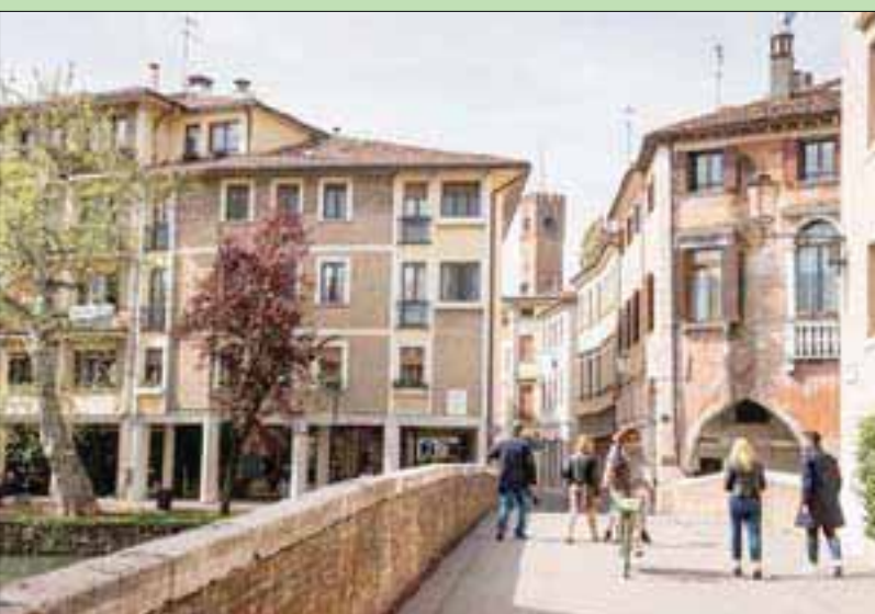
قناة في تريفيزو

الأرقام الغربية تحسب الزائرين المنفردين عدة مرات. وعلى أي حال، من الواضح أن هناك عددا كبيرا جدا من السياح الوافدين على المدينة بالنسبة إلى سكانها الذين يعانون من الزيف السياحي الهائل. وليست فينيسيا هي المدينة الأوروبية الوحيدة التي تعاني من زيادة عدد السائحين، فهناك أيضا برشلونة، وأمستردام، ودوبروفينك، وغيرها من المدن الشهيرة التي تعاني من ذلك. وقاومت بعض المدن تلك قائمة الوجهات السياحية المفرطة في عدد الزوار.