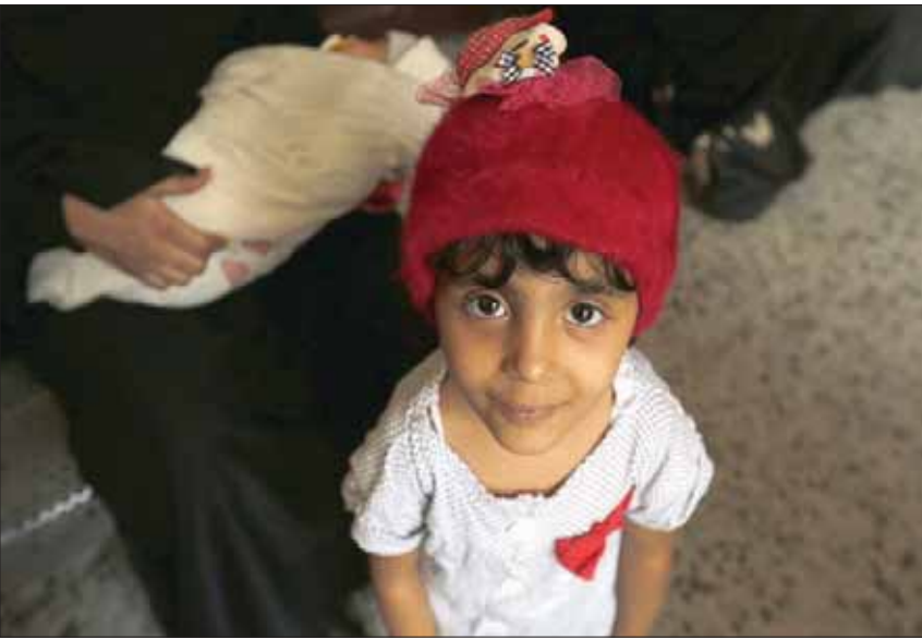
طفلة تبسم وخلفها رضية تحملها والدتها في وضع مسأري تعيشه صنعاء تحت حكم الحوثيين

ونفى القيادي الحوثي أن تكون جماعته وافقت في وقت سابق على نظام البصمة ونقلت النسخة الحوثية من وكالة «سبا» عنه قوله: «إذا كان نظام البصمة هو البرنامج مسؤول عن الإيقاف والمطالبة في تنفيذ المرحلة الأولى، ومسألة البصمة التي لم يتم الاتفاق عليها باستثناء التوقيع على بعض المفاهيم، هي مرحلة لا بد من الاتفاق بشأنها بشكل مناسب» على حد زعمه. وتؤدي الضغوط الحوثية على البرامج الأممية إلى إخراجها - بحسب المراقبين - عن وظفتها في كثير من الأحيان، كما حدث أخيراً مع البرنامج الإنمائي للأمم المتحدة الذي قدم 20 سيارة دفع رباعي للجماعة تحت مراعاً أنها ستستخدم في نزع الألغام، مع العلم أن الجماعة تقوم بشكل يومي بزراعة المزيد منها وليس زرعها.