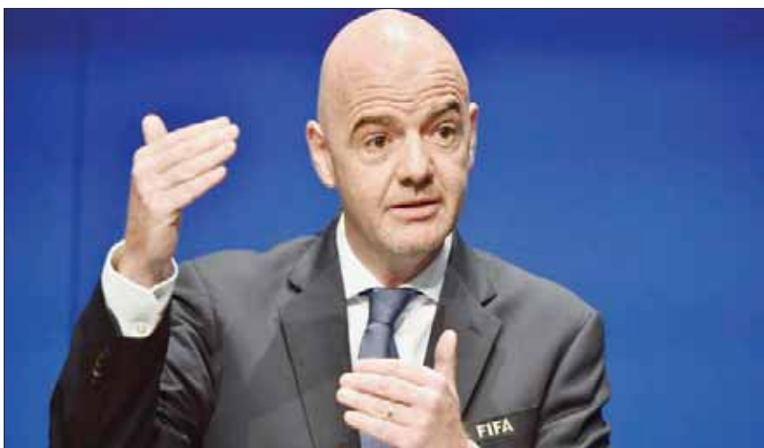
رئيس الاتحاد الدولي لكرة القدم السويسري جيانى إنفانتينو

وتونس احتجاجات واسعة في تونس من جانب الحكومة والإعلام. وقال رئيس فيفا: «كأس أمم أفريقيا ستطلق قريباً في مصر، وسيكون هناك اجتماع للمكتب التنفيذي ومؤتمر هام للغاية لكاف. ستكون مناسبة للتنسيق بين جهودنا في كل الحالات فإن فيفا يريد الإسهام في أن يخرج كاف من وضعيته الحالية». ولم يستبعد إنفانتينو أن يكون هناك تغيير في إدارة كاف. وقال رئيس فيفا: «سنرى». ولا أريد أن أختبئ حول التغيير القائل إنه كاف وإنها أفريقيا وإنها لا تعني فيفا. لا، هذا يعني».