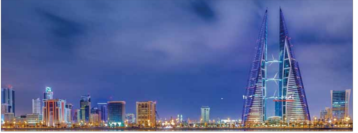
حصلت البحرين على تعهدات بمساعدة مالية قدرها 10 مليارات دولار العام الماضي من حلفائها الخليجيين (الشرق الأوسط)

والصين كأكبر دولتين تستثمران في البحرين، حيث استثمرت شركة صينية ما قيمته 50 مليون دولار واستحدثت 500 وظيفة للمواطنين.