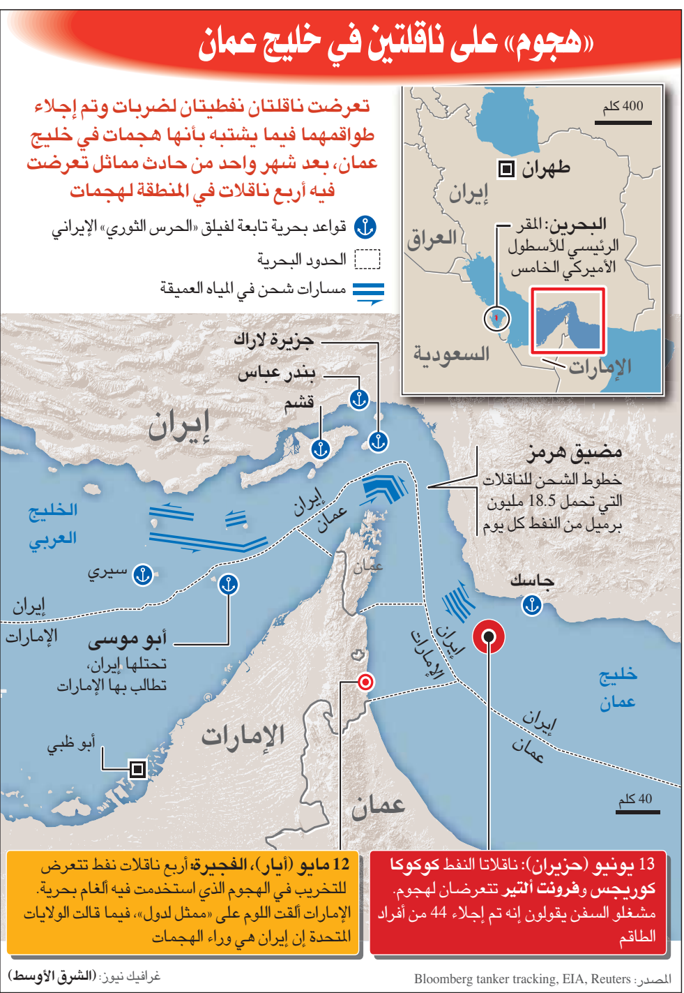
المصدر: Bloomberg tanker tracking, EIA, Reuters غرافيك نيوز: الشرق الأوسط

وكان من المقرر أن تعقد جلسة المشاورات الطارئة لمجلس الأمن في وقت متقدم الخميس بتوقيت نيويورك. وخلال كلمته في مجلس الأمن، لاحظ غوتيريش بـ«قلق عميق» ما سماه «الحدث الأمني» الذي وقع في مضيق هرمز، فقال: «أندد بشدة بأي هجوم على السفن المدنية»، مضيفاً أنه «يجب إظهار الحقائق وتوضيح المسؤوليات». وأكد أنه «إذا كان هناك أمر لا يمكن للمحلم تحمله، فهو مواجهة كبيرة في منطقة الخليج». وسألت «الشرق الأوسط» الناطق باسم الأمم المتحدة ستيفان دوجاريك عما إذا كان الأمين العام