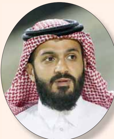
أتمار حائلي (الشرق الأوسط)

ل4 سنوات بعد أن أغلق باب الترشح دون أن يتقدم أي مرشح غيره. فيما ستعقد الإدارة الجديد لنادي الاتحاد أول اجتماعاتها لتوزيع المناصب والمهام على أعضاء مجلس الإدارة المنتخبين.