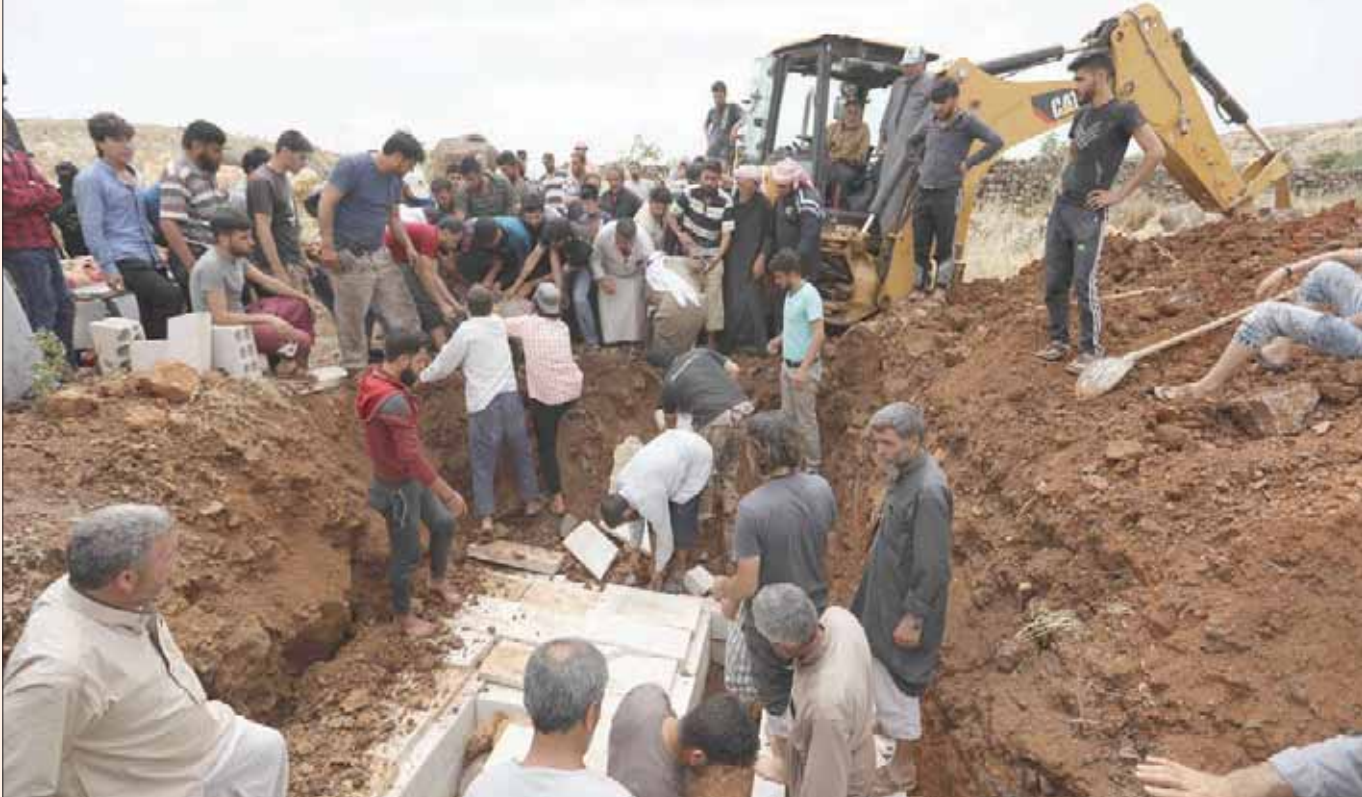
أهالي قرية كفر عويد بإدلب يفتنون ضحايا غارات جوية بينهم طفلان بداية الشهر الجاري

وأضاف البيان أن القصف، الذي نفذته قوات النظام المتمركزة في الشريعة بسهل الغاب، أدى أيضاً إلى أضرار جسيمة بالمعدات والتجهيزات في نقطة المراقبة التركية، وأنه تم إجلاء الجرحى لمعالجته، وأن الجانب التركي أبلغ الجانب الروسي بالهجوم، ويجري مراقبة الوضع عن كثب.