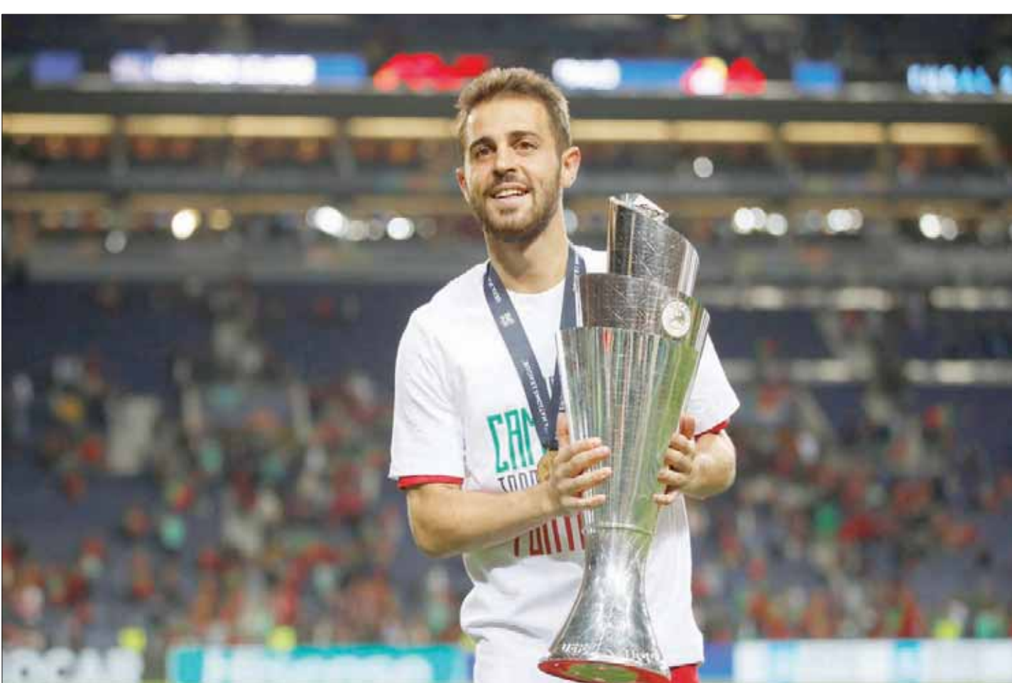
بيرناردو سيلفا تائق في الدوري الإنجليزي وفاز بكأس دوري الأمم الأوروبية مع البرتغال

ورغم ذلك، لم يفوت فرصة المشاركة سوى في ثماني مباريات بالدوري الممتاز - وقدم أداءً متالقاً في تلك التي شارك بها. في وولفرهامبتون وأندرز في نوفمبر (تشرين الثاني)، دفع به ماوريسيو بوكيتينو من على مقعد البدلاء إلى داخل الملعب، ثم دفع باخر محله في وقت لاحق. ولم يتك سون من ذلك وإنما بدأ على ذلك، سجل هدفاً في مرمرى تشيلسي خلال المباراة التالية التي شارك في التثبيت الأساسي لها وأحرز 11 هدفاً في موسم متميز من جانبها.