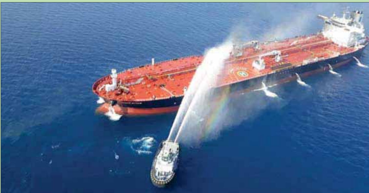
زورق يشارك في اخماد النيران في الناقله (أب)

تابعة للبحرية الإيرانية في محافظة هرمزكان (جنوب إيران) أغاثت 44 بحارا من المياه نقلوا إلى ميناء بندر جاسك».