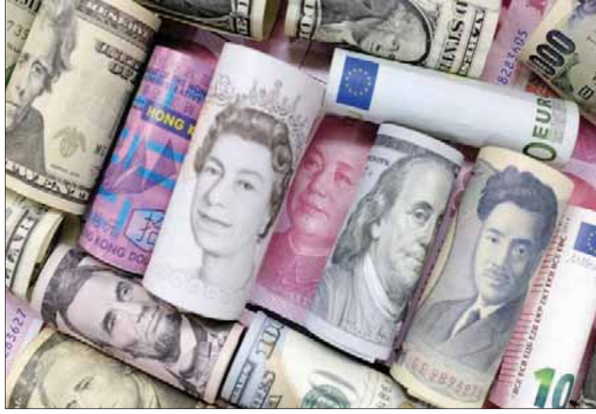
الدول المتقدمة باستثناء الولايات المتحدة تأثرت بتراجع التدفقات بنسب أكبر من تآثر دول الاقتصادات الناشئة

كما أن التراجع أصاب الدول الغنية التي شهدت تراجعاً في التدفق إليها بنسبة 27 في المائة، لتهدد الاستثمارات الآتية إليها أو بداعي «الحفاظ على الصناعات الناشئة في ظل تنافس دولي محمود على جذب الاستثمار. لكن التدفقات تأثرت أيضاً في السنوات القليلة الماضية بالحواجز التي وضعتها بعض البلدان بحجة «الأمن القومي» أو بداعي «الحفاظ على الصناعات والتكنولوجيات الاستراتيجية وحمايتها من الاستحواذات غير الوطنية»؛ ففي عام 2018 أقرت 50 دولة تشريعات تحد من مرونة الاستحواذات الأجنبية في قطاعات معينة، وتلك التشريعات التقييدية لم يسبق لها مثيل في السنوات