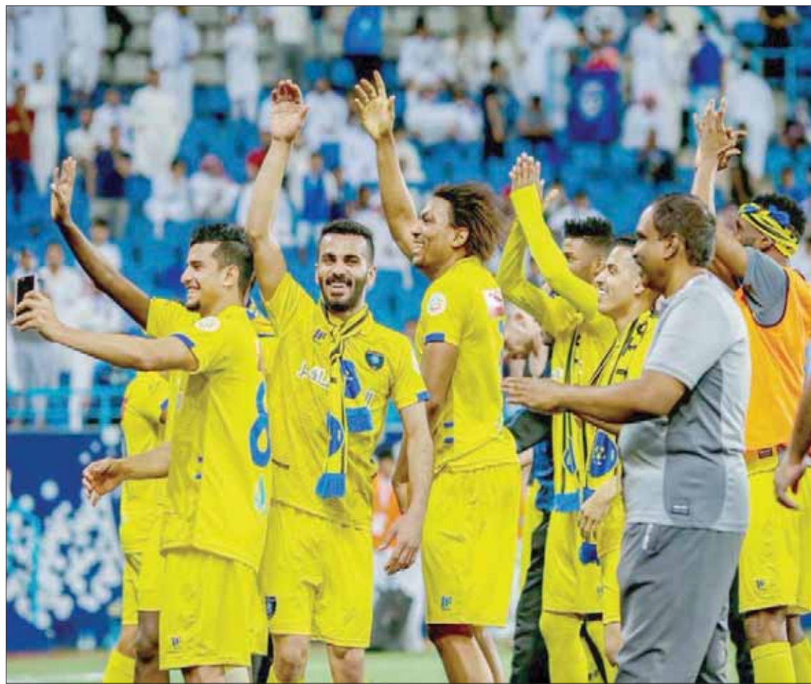
فريق التعاون يخشى الفراغ الإداري قبل انطلاق الموسم الجديد