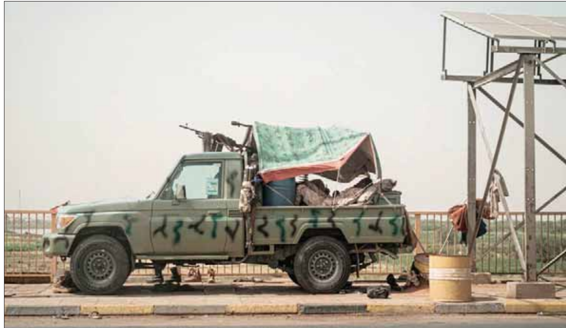
سيارة عسكرية تابعة لقوات الدعم السريع في أحد شوارع ام درمان أمس