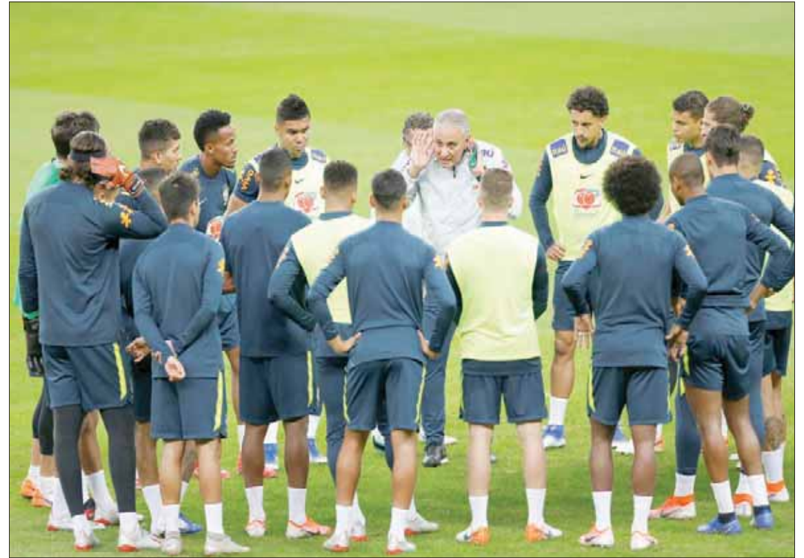
تتني مدرب البرازيل يلقي بتعليماته على لاعبيه قبل افتتاح بطولة كوبا أميركا

المراقبين برشحونه للخروج صفر اليمين من هذه المجموعة. ووسط الترشيدات القوية للمنتخبين البرازيلي والبيروفي في هذه المجموعة، ينتظر أن تكون المنافسة على المركز الثالث مشتعلة بين المنتخبين البوليفي والفنزويلي. واعتمد المنتخب البوليفي كثيرا على نقطة قوته الأساسية وهي اللعب في أليان أورغ، ورغم الفقرة القصيرة التي قضاهما مع المنتخب منذ توليه المسؤولية في يناير (كانون الثاني) الماضي، يمتلك المدرب الوطني إدواردو فيغاس من الخبرة ما يؤهله لتترك بصمة جيدة في البطولة.