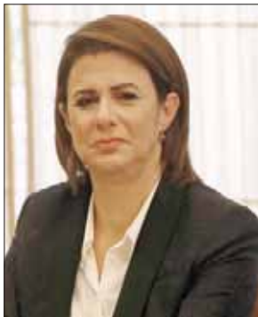
ريا الحسن

انتقدت وزيرة الداخلية والبلديات ريا الحسن ما وصفته باقتلاع النازحين من خيمهم، معتبرة أن هذا الأمر له انعكاسات خطيرة، وأكدت أن موسم الاصطياف سيكون واعداً في حال بقي الوضع الأمني مستقرًا. وأتت مواقف الحسن خلال استقبالها أمس وفد نقابة الصحافة برئاسة النقيب عون الكعكي. وأثنى الكعكي على تعيين الحسن على رأس وزارة الداخلية وهي المرة الأولى التي تتبوأ فيها امرأة في الوط العربي هذا المنصب، وقال إن اللقاء تناول أيضاً حادثة طرابلس الإرهابية، مشيراً إلى أن الوزيرة الحسن جددت التأكيد أن «من قام بهذا العمل هو نذّب مفرد