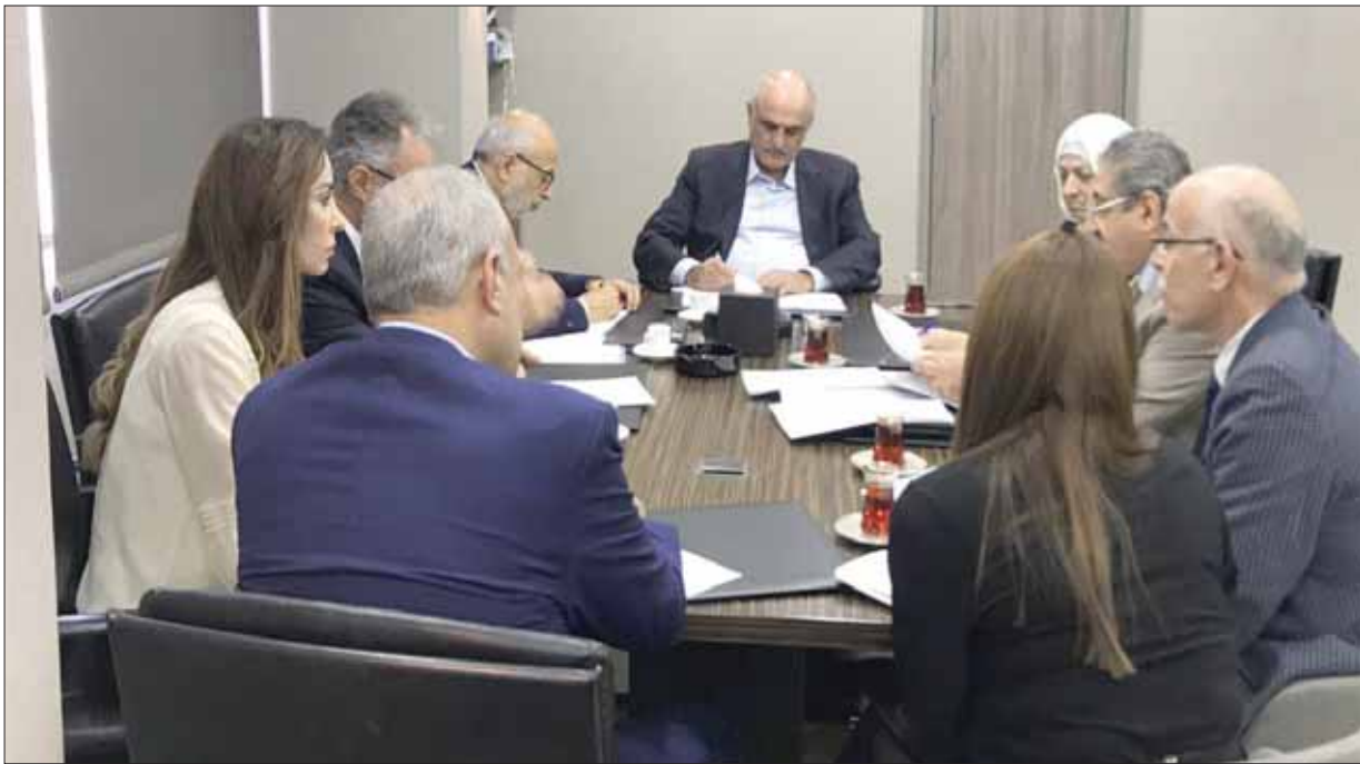
من اجتماع أمس لبحث مطالب أساتذة الجامعة اللبنانية شارك فيه وزير المال والتربية علي حسن خليل وأكرم شهيب

وصل النزاع المستمر بين أساتذة الجامعة اللبنانية والحكومة إلى مستويات غير مسبوقة مع دخول الإضراب الذي ينفذه الأساتذة ويدفع ثمنه أكثر من 80 ألف طالب أسبوعه السادس. ورغم المفاوضات التي نشطت قبل أقل من أسبوع ويثولها وزير التربية أكرم شهيب، فإن نقمة الطلبة تعاضمت أخيراً بعدما كان من المفترض أن يكونوا قد أنهوا سنتهم الدراسية ليلتفتوا لاستعداد للعام الدراسي المقبل من خلال تقديم طلباتهم إلى جامعات خارج لبنان، أو لينصرفوا لتأمين عمل صفّي، خصوصاً أن القسم الأكبر منهم ينتمي لعائلات محدودة الدخل.