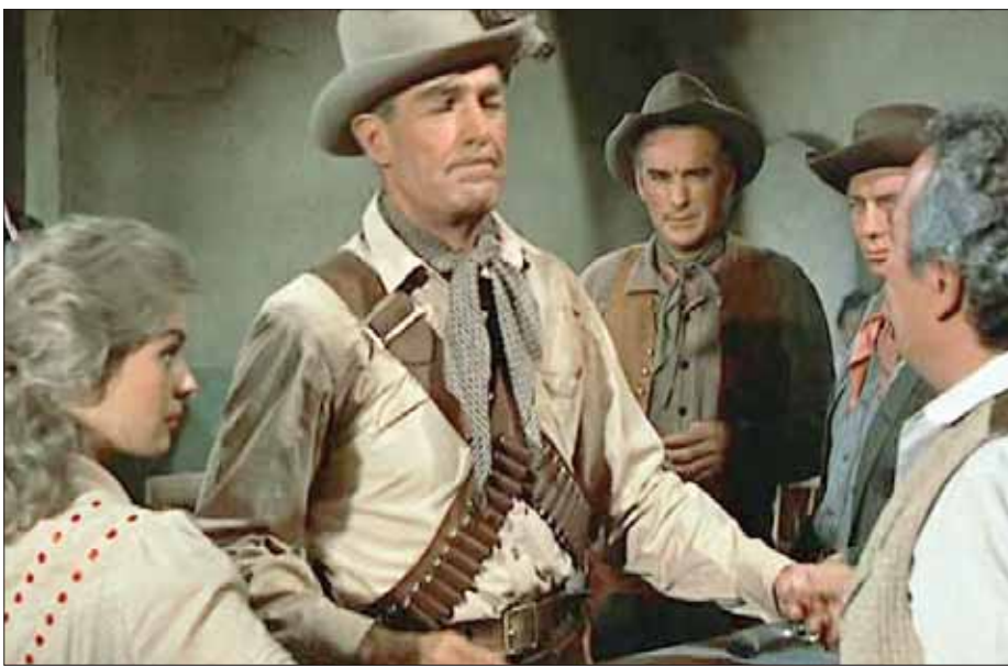
رائدولف سكوت في «بوكانن يرحل وحيداً»

وفي حين شاهدنا الكثير من الأفلام التي تدور حول أترابا بلدة فاسدين، إلا أن عائلة أغري تبدو مثالية؛ فهي في نزاع حول الغنيمة يتبعه معركة يقتل فيها كل منهما الآخر في سبيل الحصول عليها. الفيلم أخاذ بصبرياته (تصوير لوسيان بالاراد الذي عمل لاحقاً مع سام بكنبا) ورائدولف سكوت لعب في سبعة أفلام وسترن من إخراج بوويتير، أولها Seven Men From Now سنة 1957، وآخرها Comanche Station سنة 1960، وموقع هذا الفيلم هو الرابع بينها.