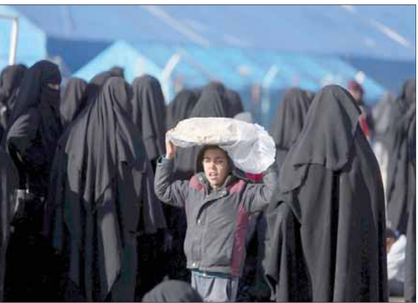
طفل يحمل رزمة خبز على رأسه في مخيم الهول المخصص لمئتين هربوا من «داعش»

ووصفت الملف بأنه دقيق للغاية. وشدد وزير العدل البلجيكي جينس كوين، على أن موقف الحكومة واضح، وهو الالتزام بإعادة الأطفال الصغار الأقل من عشر سنوات، أما الأكبر من عشر سنوات فسيتم النظر في ملفاتهم من خلال دراسة كل حالة على حدة. وأضاف أن هناك اتصالات تجري في هذا الصدد بالتعاون مع المنظمات البلجيكية والدولية للتوصل إلى صورة نهائية حول عدد الأطفال الذين يحملون الجنسية البلجيكية، والآخرين الذين يدعون أنهم يحملون الجنسية البلجيكية. وجاء كلام الوزير للبرلمان البلجيكي تعليقاً على الأنباء التي أفادت بوفاة طفلين من أبناء المقاتلين الدواعش من المقاتلين البلجيكيين. وذلك داخل أحد المخيمات بعد سقوط الباغوز، آخر معقل تنظيم «داعش».