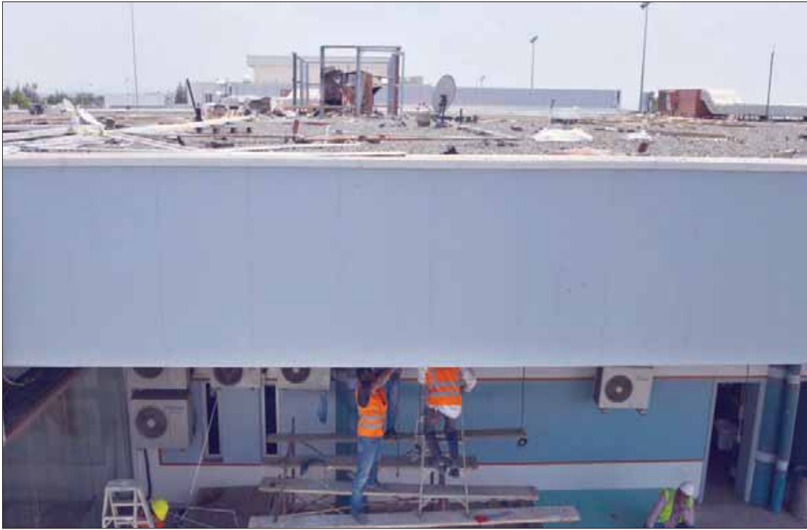
جانب من عمليات إصلاح العطب الذي أصاب صالة بمطار أبها الإقليمي أمس غداة الهجوم الحوثي