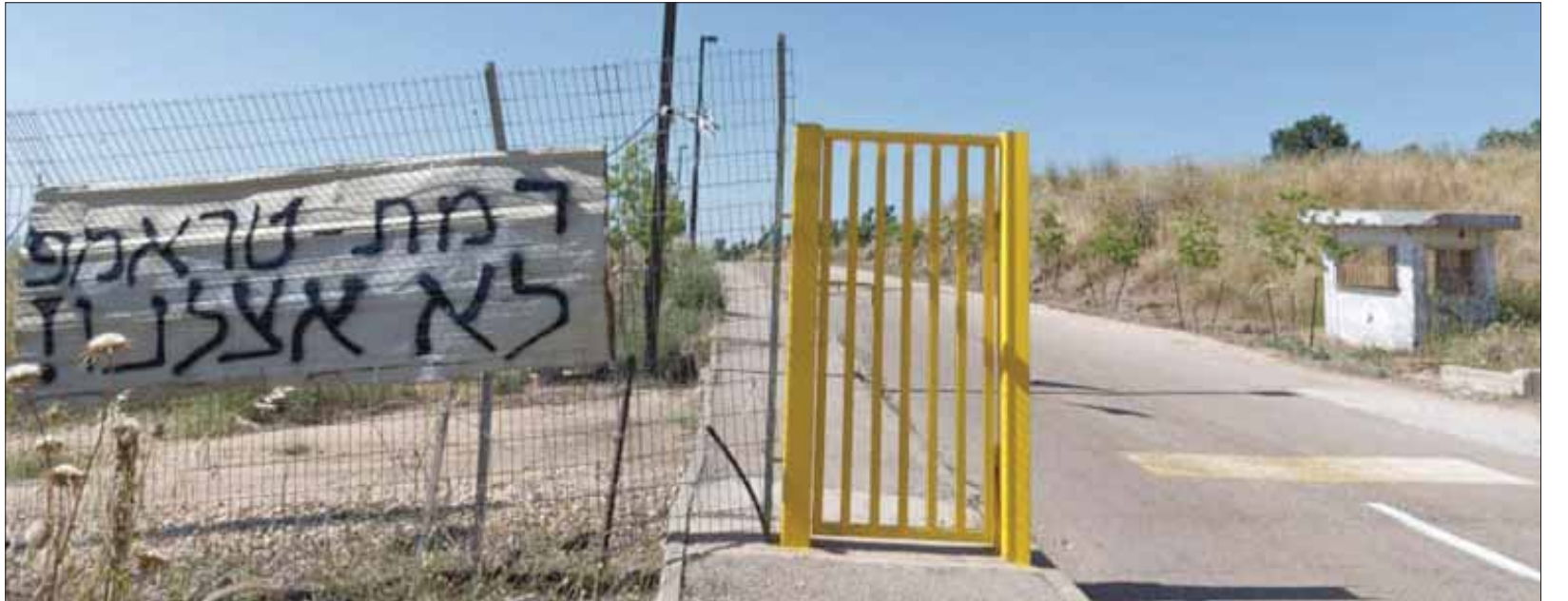
مدخل مستوطنة يُعتقد أنه سيجري تطويرها لتحمل اسم ترمب

سياسي جبار لتنتيهاهو. وقال لكن إنهم ورفاقه في الليكود يتجهون الآن إلى حصول اعتراف مماثل بالسيادة المستوطنة خلال 90 يوماً، وتكلف وزارة المالية على تخصيص الميزانية اللازمة لتعمول إقامتها». وصرح وزير السياحة زيف إكين بأن الحكومة الإسرائيلية تعتبر قرار ترمب بمثابة «تصفية نهائية للنقاش القانوني حول شرعية السيادة الإسرائيلية على الجولان وإنجاز