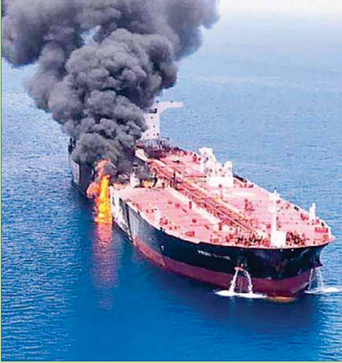
سحب الدخان تتصاعد من إحدى ناقلتي النفط اللتين تعرضتا إلى هجوم في بحر عُمان أمس

تندن: «الشرق الأوسط» رفض المرشد الإيراني علي خامنئي وساطة رئيس الحكومة اليابانية شينزو آبي الذي أنهى أمس زيارة إلى طهران أداها على أمل المساهمة في خفض التوتر في المنطقة، فيما استبعد الرئيس الأميركي دونالد ترمب التوصل إلى اتفاق مع إيران قريباً. وتجاهل خامنئي الرد على رسالة من ترمب حملها إليه آبي، وهو أول رئيس حكومة ياباني يزور إيران منذ 1978، وقال له إن ترمب «لا يستحق أن يتم تبادل