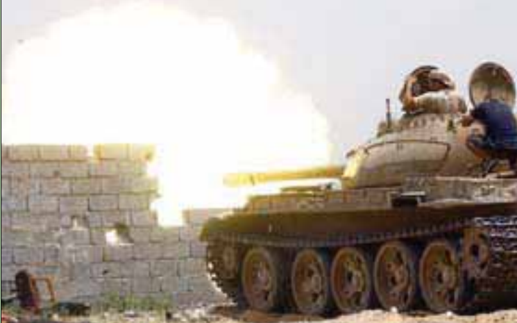
مقاتلون مواليون لحكومة «الوفاق» يطلقون النار من دبابة في منطقة السواني جنوب طرابلس أمس