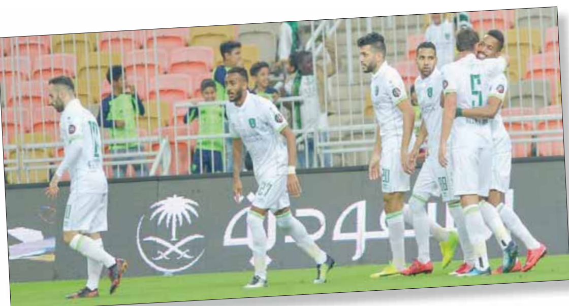
الأهلاويون يتربصون بتغييرات في الفريق الكروي