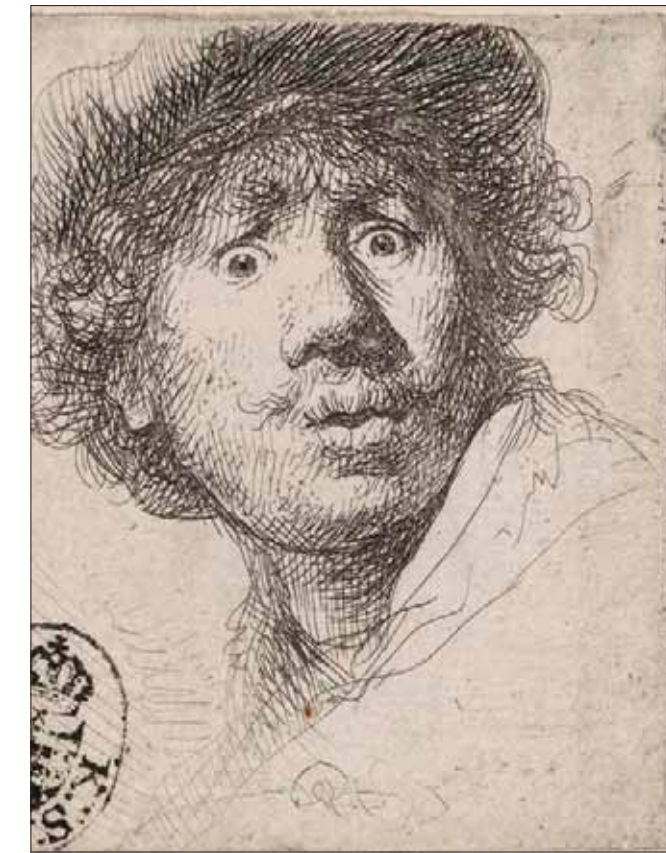
لوحة شخصية لرمبرانت (SKD)