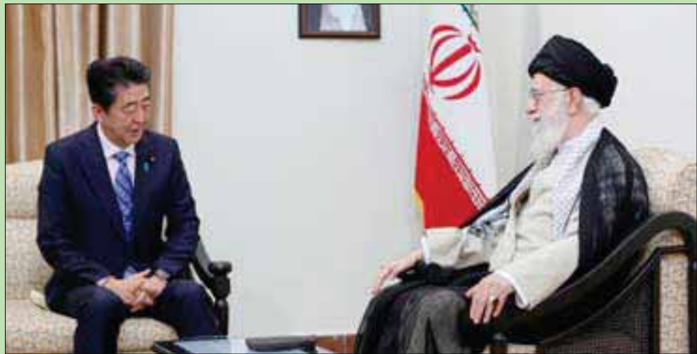
صورة نشرها موقع المرشد الإيراني علي خامنئي من لقائه مع رئيس الوزراء الياباني شينزو آبي أمس

وحذر آبي أول من أمس بعد اجتماعه مع الرئيس الإيراني من وقوع اشتباكات غير مقصودة في منطقة الشرق الأوسط. وعرضت اليابان وساطة بين إيران والولايات المتحدة بعدما أعلنت الحكومة الإيرانية وقف تعهداتها في الاتفاق النووي. وعقب العرض زار وزير الخارجية الإيراني طوكيو لتوجيه دعوة من روحاني لزيارة طهران.