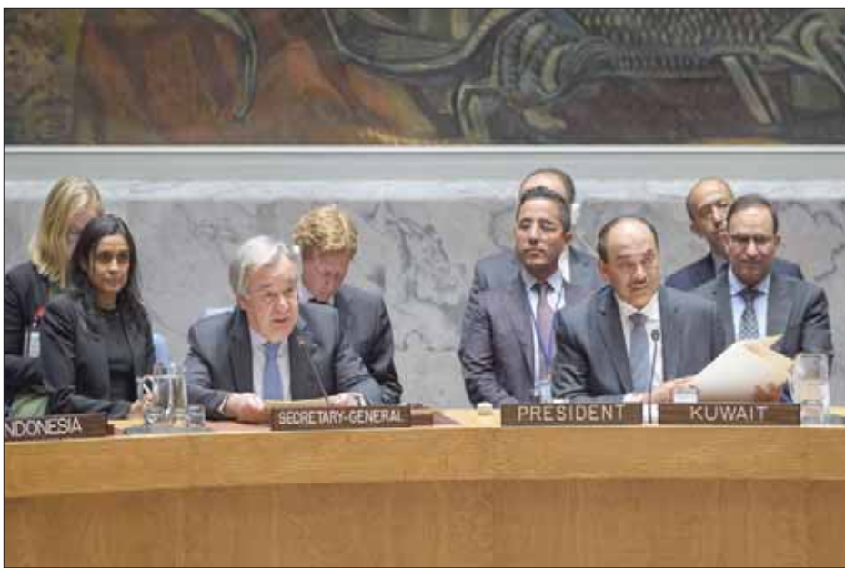
جلسة لمجلس الأمن تناقش مبادرة المفقودين «الأمم المتحدة»

وجرى التصويت على المبادرة التي قدمتها الكويت والتي لا سابق لها في كونها مخصصة حصراً للأشخاص المفقودين في العالم، في جلسة برئاسة نائب رئيس الوزراء الكويتي وزير الخارجية الشيخ صباح خالد الحمد الصباح، الذي تتولى بلاده مجلس الأمن للشهر الحالي. وحصل القرار 2474 على إجماع الأعضاء. وكان المندوب الكويتي الدائم لدى الأمم المتحدة منصور العتيبي قدّم لنتظرته في المجلس مذكرة مفاهيمية في شأن «الأشخاص المفقودين في النزاعات المسلحة»، تلخص أن العالم «لا يزال يواجه تحديات كثيرة تفرضها النزاعات المسلحة أو أوضاع العنف الداخلي التي تؤدي إلى عواقب سلبية على المدنيين، ولا سيما في الأطفال والنساء والمسنين والأشخاص ذوي الحاجات الخاصة، من أبرزها مسألة الأشخاص المفقودين في النزاعات المسلحة، حيث تعاني أسر كثيرة بسبب اختفاء أحبائهم، وتسعى بكل الوسائل إلى معرفة مصيرهم، وتذهب جهودها سدى في كثير من الأحيان»، مؤكدة أن الهدف هو جعل مسألة الأشخاص المفقودين في النزاعات المسلحة «من أول المسائل التي تتعين على أطراف نزاع ما الاتفاق على مناقشتها واتخاذ أي تدابير ضرورية في هذا الصدد، وتذهب جهودها سدى أجل تيسير عملية تحديد مصير المفقودين وأماكن وجودهم وأماكن دفن رفاتهم، فضلاً عن حماية الأدلة والشهود، وتمكين جميع العاملين في مجال البحث عن الأشخاص المفقودين ونسب المواقع التي تحضن رفاتهم، ولا سيما المتخصصون في مجال الطب الشرعي وعلوم الألة الجنائية، من أداء واجباتهم».