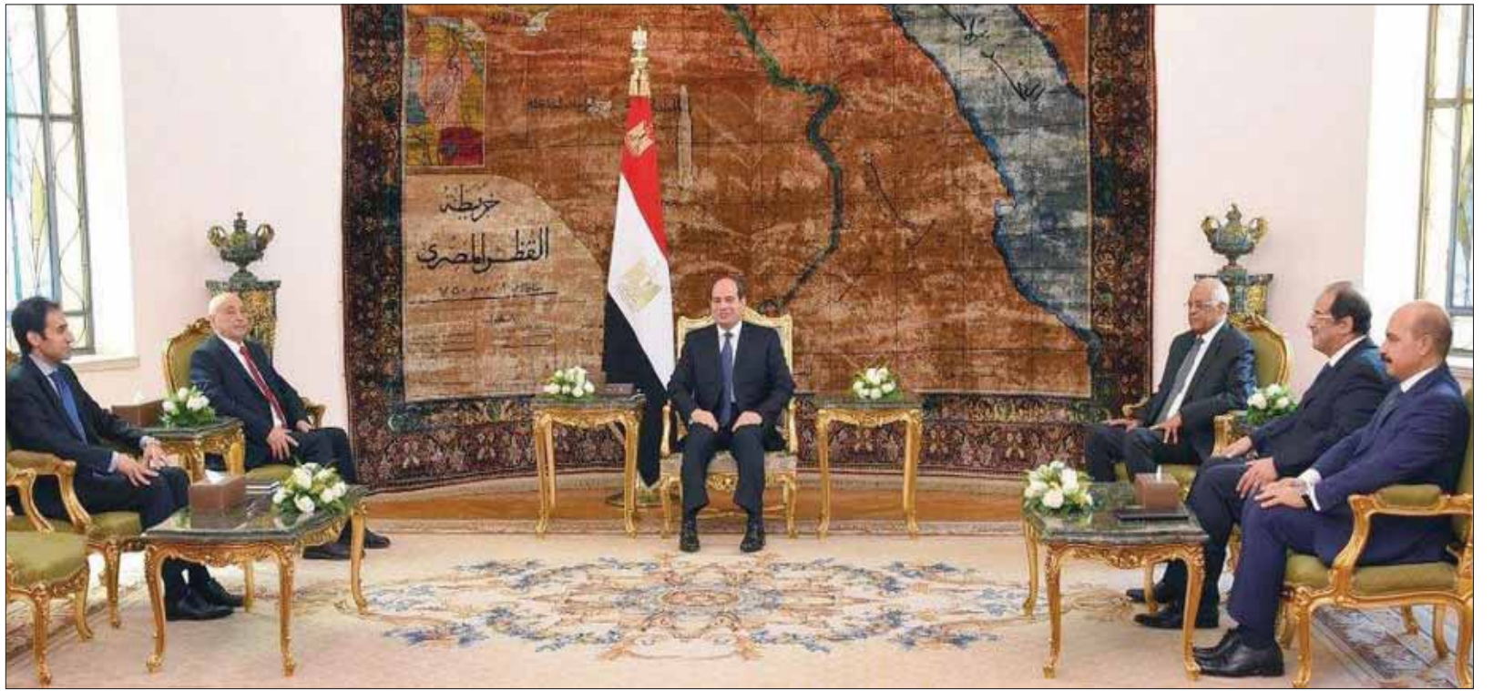
الرئيس السيسي خلال استقباله عقيلة صالح بقصر الاتحادية بحضور الدكتور علي عبد العال رئيس مجلس النواب وعباس كامل رئيس المخابرات العامة