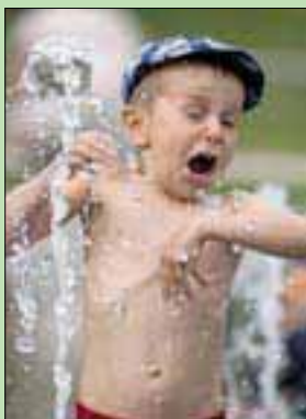
طفل يستخدم مياه نافورة في ليتوانيا