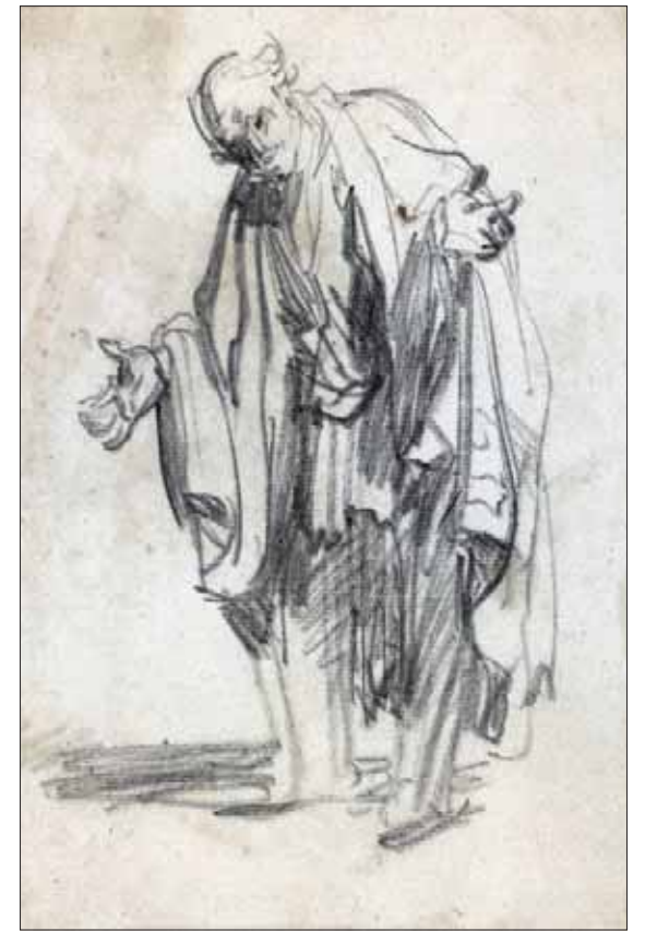
رمبرانت كما رسم نفسه (SKD)