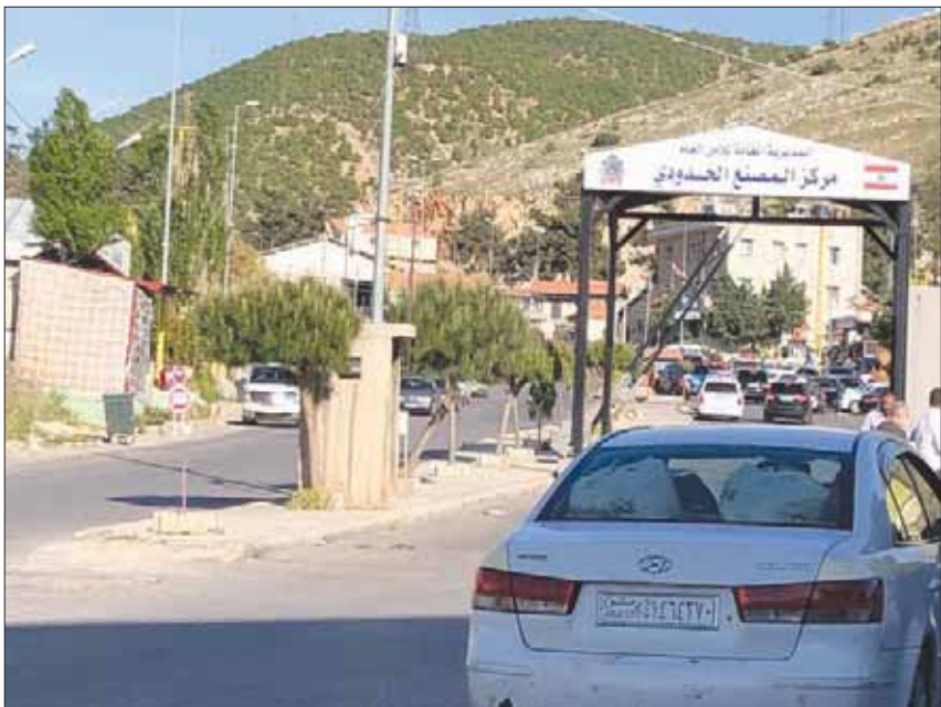
مركز أمني لبناني على الحدود مع سوريا

تحميلها، إن في السفح السوري أو السفح اللبناني بالضمان المهربة، وتمتد لتشرد على طريقتها، بينما تتم مراقبتها، فإن لاحتظتها القوى الأمنية المناط بها مراقبة الحدود، يتوارى المهرب ويتبركها لمصرها، فتصادر حمولتها وينتهي الأمر. أما إذا مرت بسلام، فيتولى المهرب أمر الحمولة ويسلمها إلى «الزبون».