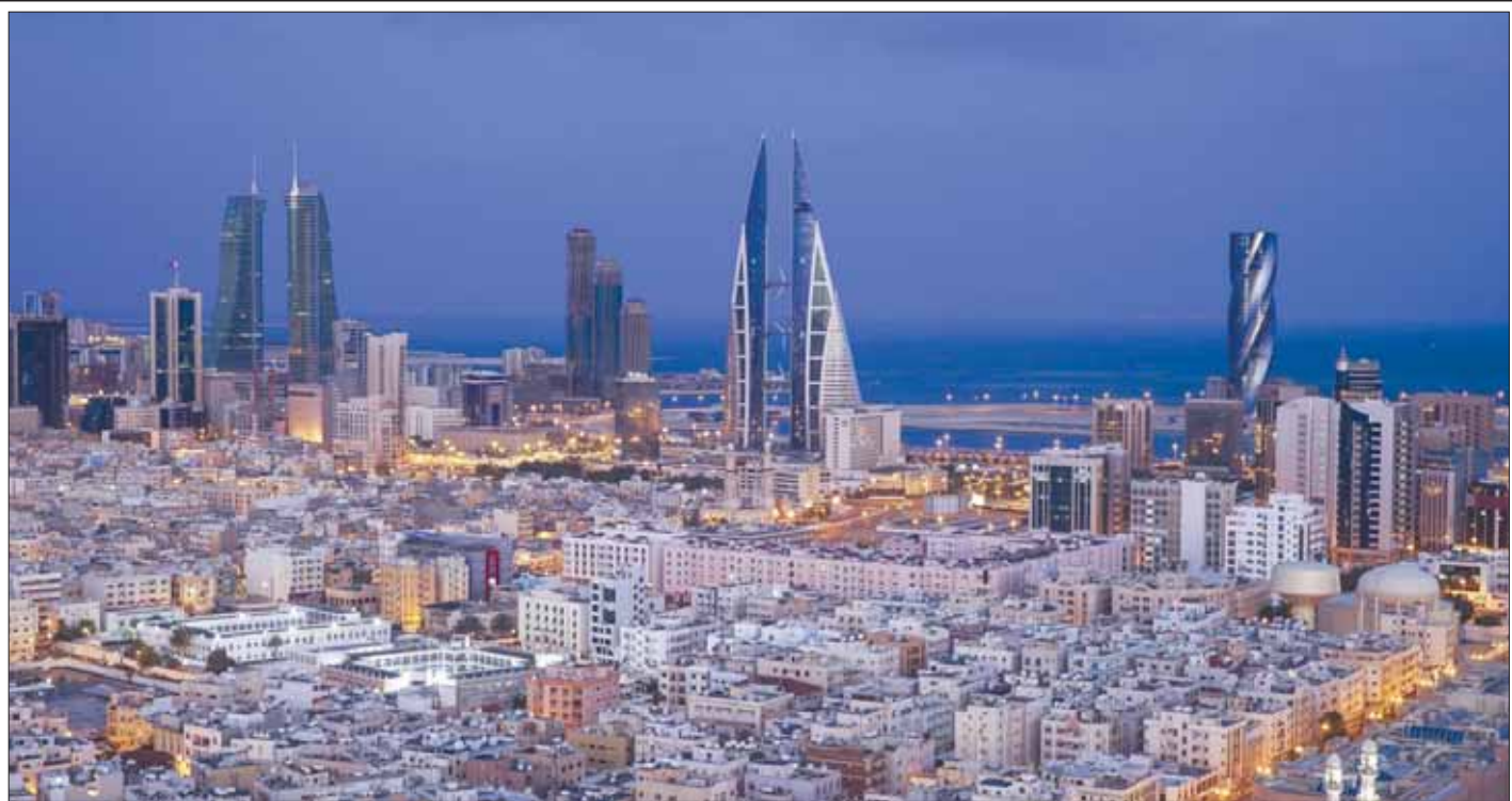
منظر عام للمعاصرة البحرينية