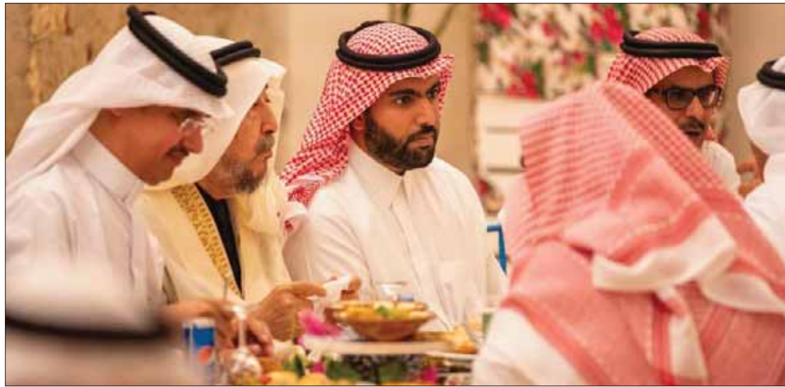
الأمير بدر بن فرحان خلال لقائه بالمتقنين السعوديين في جدة أمس