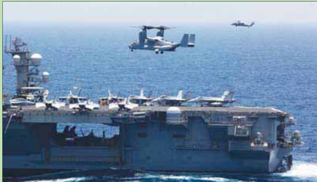
صورة نشرها الأسطول الخامس الأميركي أمس لعمليات قواته في الخليج