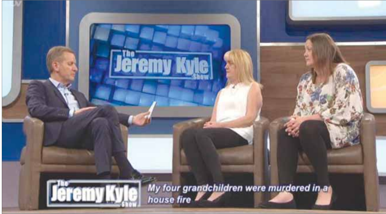
برنامج جيريمي كايل الذي ألغى بعد انتحار ضيف انطلق في عام 2005 وأحرز مشاهدات عالية في المملكة المتحدة (أي تي في)

ما هي حدود المسؤولية لوسائل الإعلام والمذيعين في مشاهدة أعلى؟ وكيف يمكن رعاية مصالح الأشخاص العاديين، سواء من المشاركين في البرامج أو غيرهم، من انتهاك وسائل الإعلام لخصوصياتهم وتعريضهم للخطر الذي يصل أحياناً إلى حد الانتحار؟ هذه الأسئلة وغيرها ظهرت على السطح مؤخراً بعدما قررت إدارة محطة تلفزيونية بريطانية اسمها «إي تي في» إلغاء برنامج المذيع جيريمي كايل بالمرّة بعد انتحار أحد المشاركين فيه، الأمر الذي اعتبرته أوساط الإعلام البريطانية أكبر فضيحة إعلامية في السنوات الأخيرة.