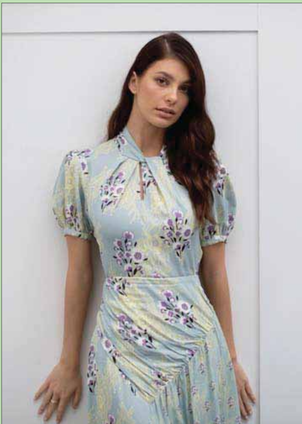
عارضة الأزياء والمثلة الأميركية كاميليا مورون خلال ترويجها لفيلم «ميكى والذب» في مهرجان كان السينمائي أمس (أ.ف.ب)

تم تداول الريال الإيراني بسعر 32 ألفاً مقابل الدولار الواحد حين الاتفاق النووي «الأوبامي» عام 2015، واليوم تخطى 140 ألفاً مقابل الدولار، وفق مُخرجاتهم؛ المزاج الأوروبي الذي كان ظريف وبقية الطرفاء الخمينيين يراهنون عليه لكسر الموقف، لم يعد مجدياً، ونجد مثلاً لمحمة من هذا المزاج الأوروبي بتحقيق نشرته مجلة «دير شبيغل» الألمانية خرج بخلاصة: «هي أن إيران «دائماً» هي الطرف الفاعل في كل أزمات الشرق الأوسط. بعد قمة مكة المكرمة الإسلامية والعربية والخليجية، التي دعا إليها الملك سلمان بن عبد العزيز سيتضح الصبح لكل ذي عينين... حانت لحظة الحقيقة».