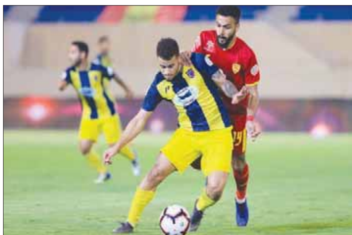
الحزم يأمل بانتهاز فرصة الملحق للبقاء في الأضواء

المحترفين، مع وجود فوارق بسيطة في الإمكانيات المادية على وجه الخصوص. وامتدح الباشا الجهد الذي يقوم به الجهازان الإداري والفني وكذلك الدعم الجماهيري المؤثر، متوقفاً أن تكون مواجهتهما الملحق متبئتين بين الفريقين.