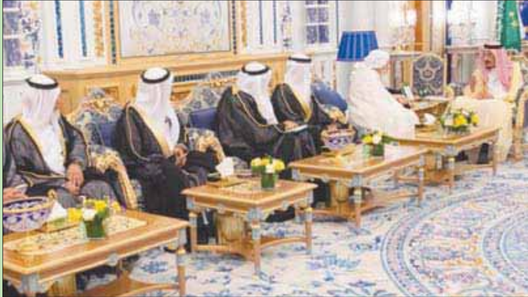
جانب من لقاء الملك سلمان في الرياض مع رئيس مجلس الإفتاء بالأمارات وأعضاء المجلس

وقالت وزارة الخارجية والتعاون الدولي الإماراتية، إن هذه الدعوة للتشاور والتنسيق حول الظروف الدقيقة التي تمر بها المنطقة وتداعياتها على الأمن والاستقرار ليست بالخيالية التي طالما حرصت وعملت على ترسيخ الأمن والسلام في المنطقة، مشيدة بالدور القيادي لخادم الحرمين الشريفين الملك سلمان بن عبد العزيز «في كل ما يجمع الكلمة ويوحد الصف وينسق المواقف». وأضافت: «إن الظروف الدقيقة الحالية تتطلب موقفاً خليجياً وعربياً موحداً في ظل التحديات والأخطار المحيطة، وإن وحدة الصف ضرورية»، مبيّنة أن