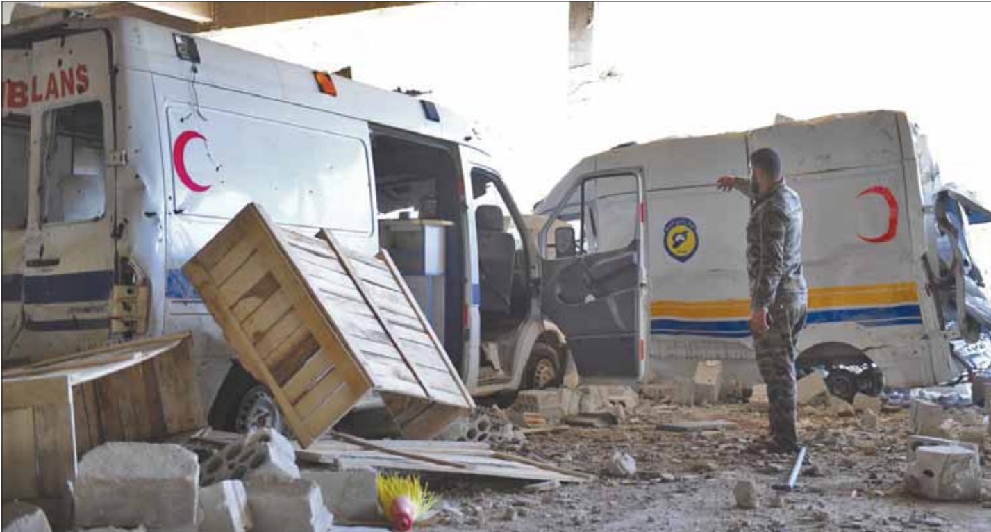
جندي من قوات النظام وسط سيارات إسعاف لقوات الدفاع المدني في قلعة المضيق دمرها الطيران أول من أمس

ومع سقوط المزيد من الخسائر البشرية فإنه يرتفع إلى 483 شخصاً ممن قتلوا منذ بدء التصعيد الأعنف على الإطلاق ضمن منطقة «خض التصعيد» في الـ30 من شهر أبريل (نيسان) الفائت، وحتى أمس، بحسب المرصد الذي وثق مقتل (164) مدنياً بينهم 32 طفلاً و37 مواطنة ممن قتلتهن طائرات النظام والطيران الروسي، بالإضافة للـ11 وطفلاً و25 مواطناً و9 نساء بينهم امرأة مع اثنين من أطفالها في القصف الجوي الروسي على ريفي إدلب وحماة، و25 مدنياً بينهم 7 نساء وطفلة استشهدوا في البراميل المتفجرة من قبل الطائرات المروحية، و55 بينهم 12 مواطناً، و11 طفلاً وعناصر من فرق الإنقاذ، استشهدوا في استهداف طائرات النظام الحربية. كما استشهد 29 شخصاً بينهم 5 نساء وطفل في قصف بري نفذته قوات النظام، و21 مدنياً بينهم 10 أطفال و3 نساء في قصف الفصائل على السفليبة ومخيم النرب وأحباء بمدينة حلب، كما قتل في الفترة ذاتها (169) على الأقل من المجموعات المتشددة والفصائل الأخرى، في الضربات الجوية الروسية وقصف قوات النظام واشتباكات معها، بالإضافة لمقتل (150) عنصراً من قوات النظام في استهدافات وقصف من قبل المجموعات «الجهادية» والفصائل.