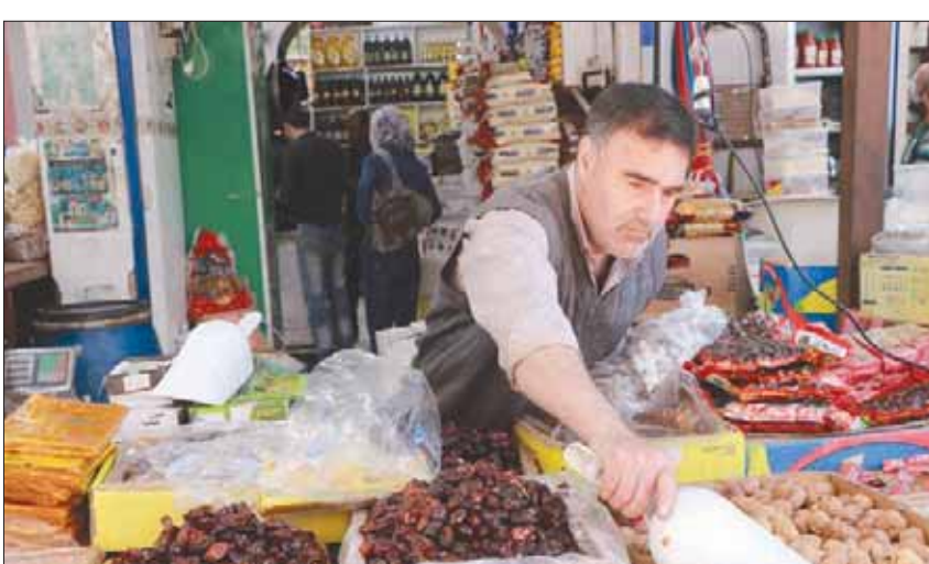
تمور رمضان وسلع أخرى مرتبطة بالشهر باتت صعبة الشراء، في الحسكة