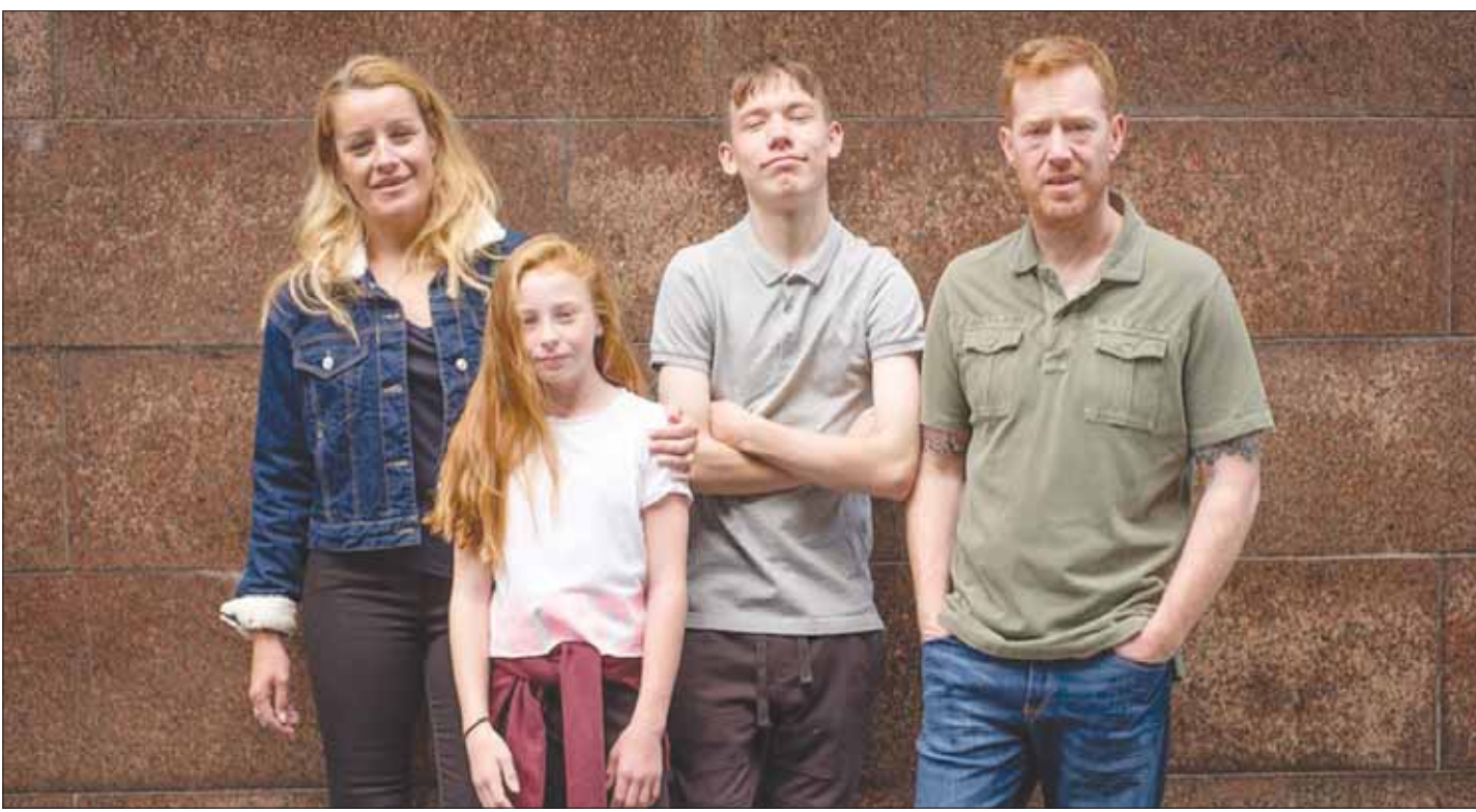
عائلة كن لوتش في «أسف افتقدناك»

لكن ما إن يتخطى الفيلم نصف ساعته الأولى من رسم الشخصيات وتأسيس أمانكها في الوضع الذي تعاليشه حتى يتطور الفيلم كعمل لا يمكن تجاهل قيمته لا الفنية ولا الاجتماعية.