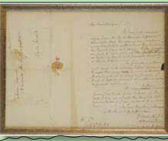
الرسالة التي كتبها ألكساندر هاملتون عام 1780 (أرشيف ماساتشوستس الوطني)

مجموعة وثائق كان من بينها خطاب هاملتون، يحذر الخطاب قد سلط الضوء على من ثلاث فقرات، والذي قُدرت قيمته ما بين 25 ألفاً إلى 35 ألف دولار أميركي، حسب دار مزادات فيرجينيا، الجنرال الفرنسي لافيتي، الذي تولى قيادة الكثير من القوات خلال حرب الاستقلال الأميركية، من خطر محقق من قبل البريطانيين.