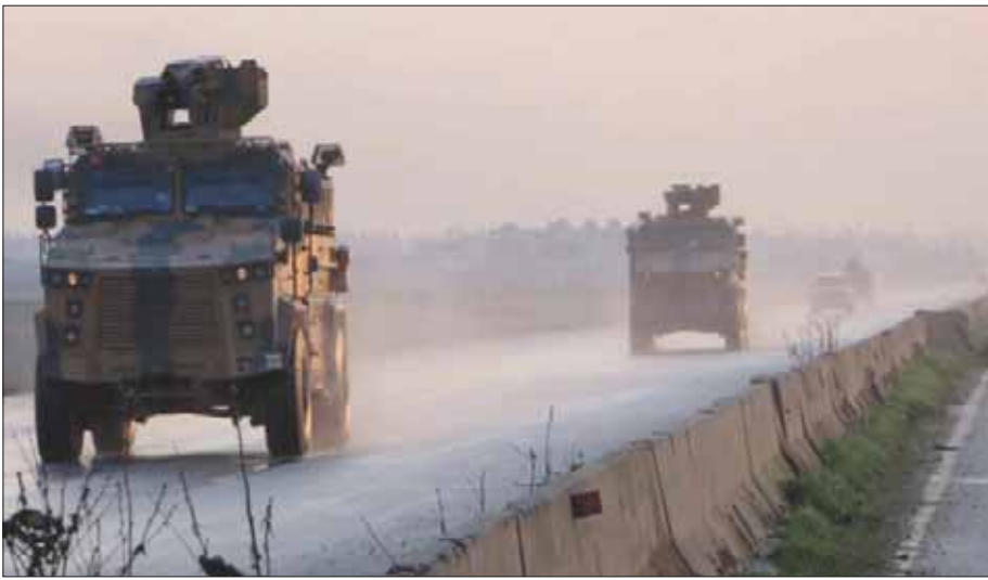
صورة أرشيفية لقافلة عسكرية تركية في طريقها إلى الحدود السورية نهاية العام الماضي

إخواننا الكركات والعرب والتركان السوريين تحت رحمة الأطماع الاستعمارية الجديدة»، مشيراً إلى أن تركيا ألحقت خسائر كبيرة بالإرهابيين، منذ أن بدأت عملياتها ضد الإرهاب بشكل متواصل، وأنزلت ضربات موجعة بتنظيم «داعش» الإرهابي، وامتدادات «حزب العمال الكردستاني» في سوريا (في إشارة إلى «وحدات حماية الشعب» الكردية)، وظهرت مساححة تقدر بأكثر من 4 آلاف كيلومتر مربع