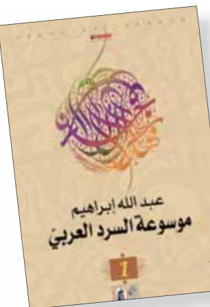
موسوعة السرد العربي