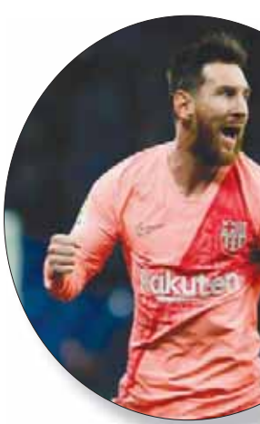
ميسي يهدف الدوري سجل ثنائية جديدة

فالفيردي في الدقيقة 69. وواجه لاعبو الريال صارات استهجان جماهير ملعب «سانتياغو برنابيو» التي لم تستغف الخسارة الخامسة للفريق على أرضه هذا الموسم. وتناول زيدان موضوع بيل المرشح بقوة لغدارة النادي الملكي، قائلاً: «أنا متأسف لأنني لم أمتح بيل فرصة لعب بعض الدقائق. لكنني لا أدري ما الذي سيحصل مستقبلاً».