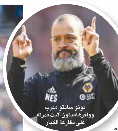
نونو سانتو مدرب وولفرهامبتون أثبت قدرته على مقارعة الكبار

لكن الأمر تغير بمرور الوقت، وتغيرت اقتصاديات اللعبة، وتطورت الخطط الفنية والتكتيكية وفقاً لذلك، واتسعت الفجوة بين الأندية الغنية والأندية الفقيرة في الدوري الإنجليزي الممتاز للدرجة التي جعلت محاولة الأندية القريبة من القاع في جدول الترتيب للاستحواذ على الكرة أمام فرق المقدمة أمراً شبه مستحيل. وهناك إحصائية تكرر بانتظام، لكنها تعكس ملاح لعبة كرة القدم في الوقت الحالي، حيث تشير شركة «أوبتا» إلى أنه خلال الفترة بين موسمي 2003 - 2004 و 2005 - 2006، عندما بدأت الشركة في جمع البيانات لأول مرة، فإن 3 مباريات في الدوري الإنجليزي الممتاز وصلت فيها نسبة الاستحواذ على الكرة من جانب أحد الفريقين إلى 70 في المائة أو أكثر. وقبل موسمين، ارتفع عدد المباريات التي يستحوذ فيها ناد على 70 في المائة أو أكثر إلى 36