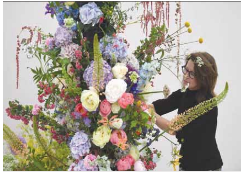
مشاركة في معرض تشيلسي للزهور تضع المسامات الأخيرة على حدائقها قبل الافتتاح