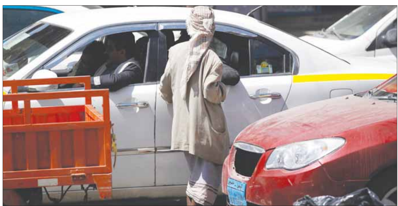
متسول يطلب المال عند إشارة مرور في صنعاء

وتتهم الكثير من اليمنيين الجماعة الحوثية ومشرقيها بأنهم باتوا يعيشون كافة مظاهر الفراء الفاحش، بعد أن كان أغلبهم يعيش حياة عادية أو مسحوقة، مشيرين إلى انتعاش سوق العقارات في صنعاء وغيرها من المناطق الخاضعة للميليشيات بسبب حالة غير عادية من الإقبال الحوثي على الشراء. وتقدر مصادر اقتصادية يمنية رسمية أن عائد الموارد المالية من المؤسسات الحكومية في مناطق سيطرة الجماعة الحوثية يزيد عن 13 ألف دولار. ويستغرب الناشطون اليمنيون من الشعارات التي يطلقها متحدث الحوثيين عبد السلام فليقة سواء على مواقع التواصل الاجتماعي أو في المحافل الدولية التي يتجول فيها بتنسيق اللوبي الدولي المساند للجماعة الإيرانية، لجهة التأكيد على الحالة الإنسانية في مناطق سيطرة الجماعة الحوثية في الوقت الذي لا يتورع فيه عن إهدار ملايين الريالات على شراء ملابسهم وزينتهم الشخصية. هذه الحالة الباذخة التي ظهرت على متحدث الجماعة الحوثية في الخارج، لها نظيراتها في المناطق الخاضعة للجماعة في اليمنيين.