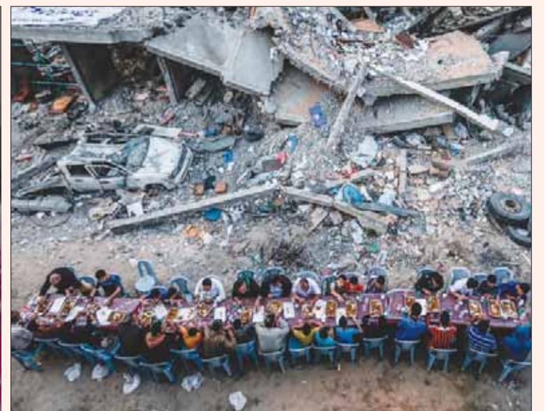
عائلات فلسطينية على مائدة إفطار بين أنقاض منازلها المدمرة بفعل الغارات التي شنتها إسرائيل على قطاع غزة قبل أسبوعين