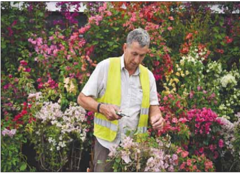
مشارك يقوم بوضع المسامات الأخيرة قبل المعرض

لمحي تنسيق الحدائق وعشاق البستنة أو الزهور