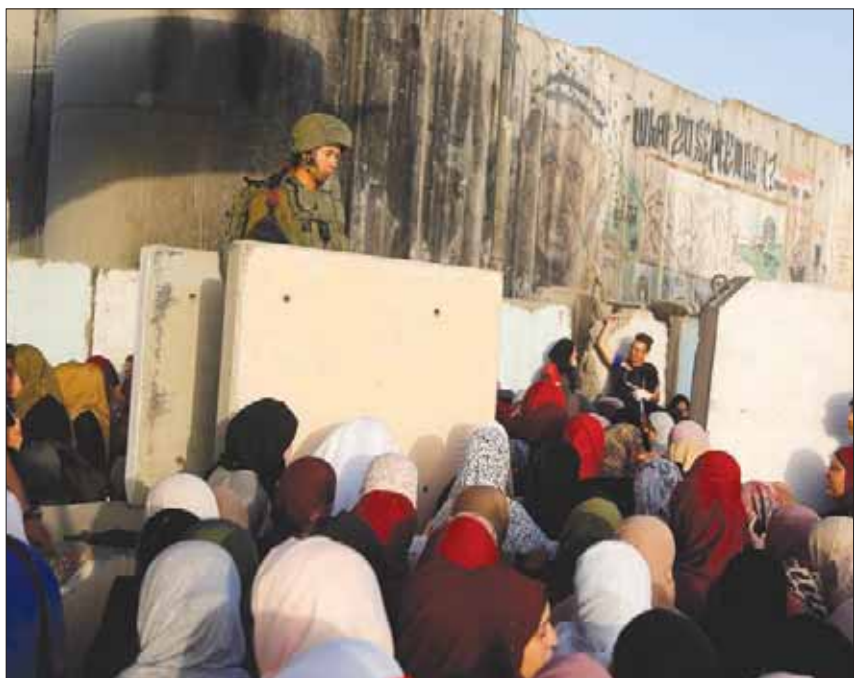
مصلون متجهون للصلاة في «الأقصى» عند حاجز قلندية الإسرائيلي الجمعة الماضي

المصلى القبلي والمرواني. ودعا المفتي الأمتين العربية والإسلامية، والمجتمع الدولي بمؤسساته كافة، إلى وقفة حقيقية لرد هذا العدوان الأثم على المسجد الأقصى المبارك، محذراً من الأعداءات الخطيرة على المنطقة بأسرها، جراء هذا الصمت على هذه الأفعال، التي تنتهك الشرائع السماوية والأعراف والمواثيق الدولية كافة، التي تعتبر الأماكن المقدسة، الإسلامية والمسيحية، جزءاً أصيلاً من القدس، عاصمة الدولة الفلسطينية. وجدد المفتي الدعوة «لشد الرحال إلى المسجد الأقصى المبارك، لنصرته والنزود عنه في ظل هذا الاستهداف الخطير والمنهج». وتختلف اقتحامات المستوطنين هذه اتفاقاً قائماً بين إسرائيل والملكة الأردنية، بصفتها راعية المقدسات الإسلامية، وينص على تحديد عدد اليهود الذين يزورون المسجد الأقصى، وامناعهم عن القيام بأي صلوات أو طقوس دينية. ويعرف هذا الاتفاق بالوضع القائم منذ احتلت إسرائيل الشق الشرقي في مدينة القدس عام 1967. وتستمر الاقتحامات على الرغم من تحذير السلطة الفلسطينية والأردن من تدهور كبير في الأوضاع، بسبب استفزاز المسلمين، طالما حذرت السلطة من إشعال إسرائيل حرباً دينية، بإصرارها على السماح للمستوطنين باقتحام المسجد الأقصى والمس به. وفي المقابل تمنع إسرائيل الاعتراف في المسجد الأقصى في رمضان، وتقيد دخول المصلين طيلة أيام الأسبوع، باستثناء الجمعة.