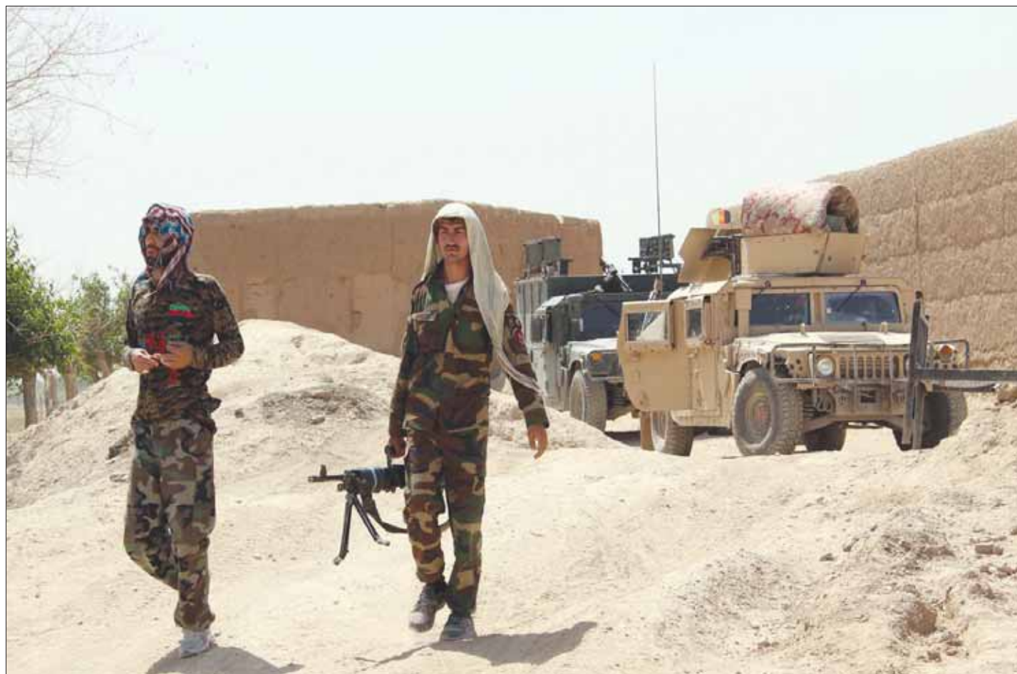
قوات أفغانية في نقطة مراقبة وتفتيش بولاية هلمند أول من أمس