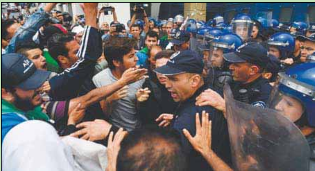
الجزائر، بوعلام غمراسة

نقى رئيس الوزراء الجزائري سابقاً أحمد بن بيتور، صحة أنباء تم تداولها أمس حول اختياره من طرف الجيش لرئاسة الحكومة خلفاً لنور الدين بدوي، المفروض شعبياً، فيما توقفت وزارة الداخلية أمس عن إصدار استمارات الترشح، للرئاسة المقررة في 4 يوليو (تموز) المقبل، إيداً ببدء إيداع ملفات الترشح لدى «المجلس الدستوري».