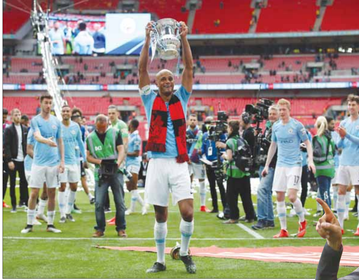
كومباني يحتفل بكأس إنجلترا في آخر ظهور له مع مانشستر سيتي

أريد مشاركة معرفتي مع الجيل الجديد. مع هذا، سأقوم بوضع قطعة من مانشستر في قلب بلجيكا». على جانب آخر، كان انتصار سيتي الكاسي 6 - صفر على واتفورد في نهائي كأس الاتحاد الإنجليزي وضمان الحصول على الثلاثية المحيية، هو انعكاس لشراسة الفريق في المباريات الكبرى، وهيمان برشلونة المنتخب الإسباني على اللعبة بعد عام 2000 بفضل أسلوب التمريرات القصيرة السريعة لكن الجهد المبذول يكون أكبر عند فقد الكرة، وقد نقل غوارديولا، الذي تربي في كامب نو، هذه العقيلة إلى لاعبي سيتي. وعادة لا يملك راجيم ستيرلينغ وديفيد خبير قوة بدنية كافية للفرز في الالتحامات الهوائية، لكن تعاون الاثنان للتحقق على مدافعي واتفورد الأكثر صلابة ليسجل سبيلها الهدف الأول بعد 26 دقيقة. وتواصل الضغط الهجوسي الذي أنهك واتفورد ليعادل سيتي أكبر انتصار في تاريخ البطولة الأقدم في العالم والتي يمتد عمرها 147 عاماً. وحول غوارديولا، ستيرلينغ إلى جناح خطير صاحب لمسة حاسمة أمام المرمرى بعد أن هز الشباك 50 مرة تقريبا في آخر موسمين. وقال ستيرلينغ: «ظهر اللاعبون بشكل رائع. ساهمت أهدافي في الفوز وتوضح ما بينه المدرب هنا. أخرجنا بالحاجة للاحتفاظ بالعقيلة المطلوبة وأنجزنا المهمة على نحو مثالي». وواصل: «نعرف بعضنا بعضاً بشكل أفضل الآن ونذكر معايرنا ولا يمكن الإفراط في التفكير بالحصول على أربعة ألقاب في موسم واحد».