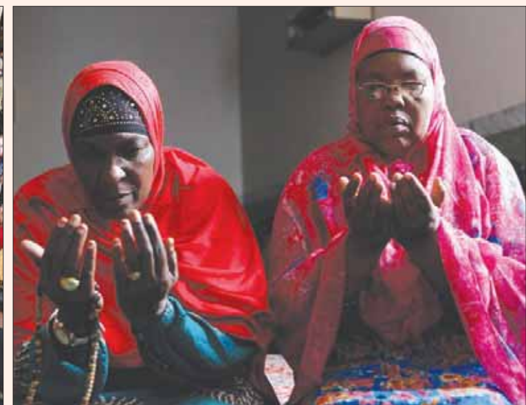
مسلمات يؤدين الصلاة خلال شهر رمضان الفضيل في العاصمة الكينية نيروبي