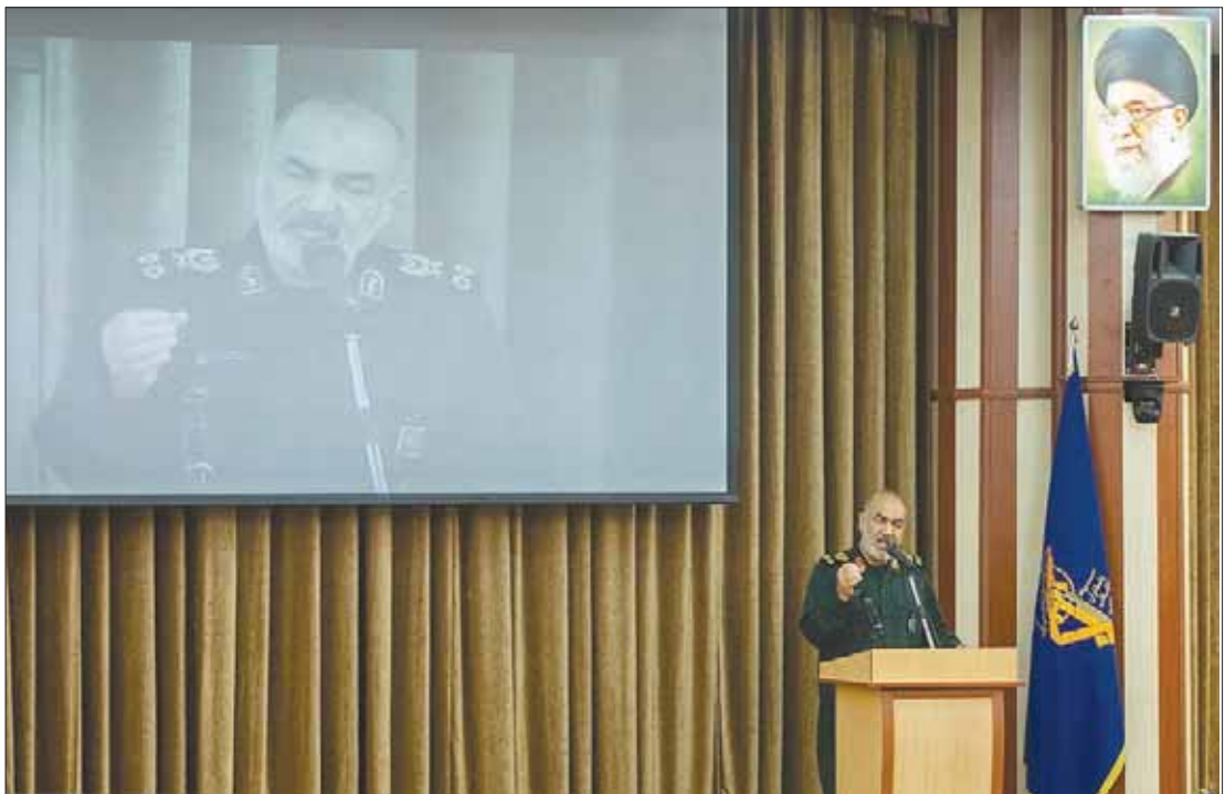
قائد «الحرس الثوري» حسين سلامي يلقي خطاباً أمام قادة «الحرس» في طهران أمس

في كل أجزاء قوتنا الدفاعية، والقوة كائن حي يجب أن يستمر في التطور». واختار المرشد الإيراني علي خامنئي حسين سلامي قائداً لـ«الحرس» خلفاً لمحمد علي جعفري بعد أيام خطة تصفير النفط وتصنيف «الحرس الثوري» على قائمة المجموعات الإرهابية.