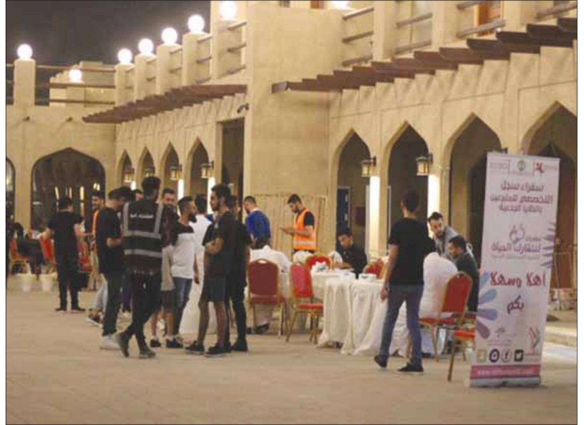
جانب من مهرجان ليالي رمضان وسط العوامية

تقريباً، متوقع ارتفاع وتيرة الزوار من مختلف مناطق الشرقية خلال الأيام القادمة. وقدر المحسن عدد الزوار في الليلة الأولى بنحو 6 آلاف زائر، لافتاً إلى أن الوفرة التصاعديّة لعدد الزوار ستكون خلال الأيام المتبقية، مضيفاً أن فعاليات المسرح الخارجي ستكون حيث ستضمّن الكثير من الفقرات الثقافية الهادفة للأسرة والطفل.