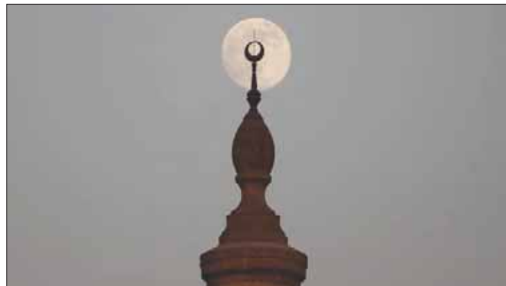
رؤية بدر رمضان مكتملاً قبل مواعده جدل يتجدد في مصر

القمر، وليس على يوم رؤيته. وقال: «يجوز أن يكون هلال القمر موجوداً في السماء، ولكن يصعب رؤيته بالعين المجردة نظراً لظروف مناخية أو جوية معينة كوجود سحب أو غبار على الأفق الغربي للبلاد». وأوضح د. تادرس أنه من ناحية أخرى ليست هناك إمكانية لتأكيد اكتمال بدر القمر بالعين المجردة دون أجهزة، فالقمر يكون مضاءً بنسبة 97 في المائة لفتره العين مرة، أو غبار على الأفق الغربي للبلاد». وأضاف: «على هذا، يبدو القمر لنا بدرًا لمدة ثلاثة أيام على الأقل، يوم قبل البدر الحقيقي، ويوم البدر نفسه، ويوم بعد البدر الحقيقي». ووفق الحسابات الفلكية، فإن القمر أصبح بدرًا مكتملاً أمس، بعد منتصف الليل، وهو ما يدعم ما ذهب إليه الحسابات من أن شهر رمضان هذا العام سيكون 29 يوماً، كما أكد تادرس في تصريحات خاصة لـ«الشرق الأوسط». وأضاف أن ذلك يؤكد أيضاً صحة الحسابات