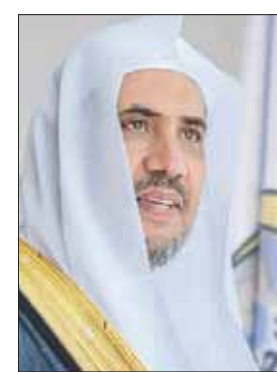
الدكتور محمد العيسى

واللاجئون الفلسطينيون واللاجئون السوريون في لبنان، واللاجئون الفلسطينيون واللاجئون السوريون في الأردن، واللاجئون من برما في بنغلاديش. وتطرق إلى أن رابطة العالم الإسلامي تسعى من خلال هذه المشاريع إلى إدخال الفرحة والسرور إلى المحتاجين واللاجئين والنازحين وأسراهم وتعزير الروابط الاجتماعية وترسيخ مبدأ التكافل بين الجميع، منوهاً إلى إيلاء الرابطة اهتماماً خاصاً لهذا المشروع لروحانية شهر رمضان الذي يتطلب الوقوف مع اللاجئين في محنتهم وتقديم أفضل الخدمات الإنسانية لهم التي من شأنها أن توفر المتطلبات الأساسية للصمود في مثل هذه الظروف الصعبة. يذكر أن رابطة العالم الإسلامي مستمرة بتنفيذ برنامج إفتار صائم وكبش العيد في عدد من الدول في قارات أفريقيا وآسيا وأوروبا بتكلفة تجاوزت 800 مليون ريال (213 مليون دولار) استفاد منها أكثر من 30 مليون شخص منذ إطلاق هذه البرامج.