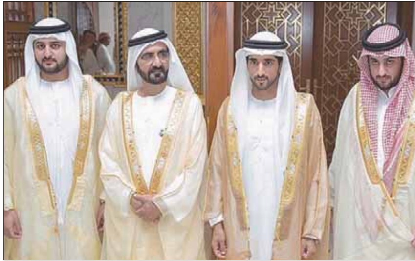
الشيخ محمد بن راشد آل مكتوم يتوسط أبناءه خلال حفل عقد القران

الاجتماعي: «إبارك لأبنائي الثلاثة، متمنياً لهم دوام التوفيق والفرح وسعادة أسرية غامرة»، كما وجه مجلس دبي الرياضي، التهنية إلى الشيخ محمد بن راشد بمناسبة عقد قران ابنائه، ونشرت الشبهة لطيفة بنت محمد بن راشد صورة إخوانها الثلاثة، عبر موقع «إنستغرام» لعرض الصور، وكتبت تعليقاً مع الصورة تضمن: «فرحة وطن».