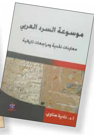
موسوعة السرد العربي

ثقافياً لدى الباحث، أساسه التراثية الهرمية، مع نفي التعددية عن المؤنث، بإقرار مواضع رسمتها المنظومة الأيوبية. وتخير الباحثة، في حوار معرفي عميق مع أطروحات الباحث في حقل النسوية والأيوبية، أسئلة مهمة وتفقيديات جدلية، وتخلص إلى أن «أغلب الروايات التي اخترها الناقد ليست نسوية، لأنها تعبر عن رؤية وأقعية تعامل نمطية مع الجسد»، وتعرّز رأياً هذا بمعالجات إخراجية للنصوص التي تناولها إبراهيم في موسوعته برؤية نقدية تفرسية، مشيرة إلى أن الباحث يلج على عدم الاعتراف بان الأنوثة هي أهم تحليات الرواية النسوية العربية، وأنه أكثر الإطراء من منزع مؤسسى يرى أن كل ما تدعو له النسويات مجرد فذكرة فكرية وحذقة كتابية، ويدجور بروج لعملة مغلفة بالتصنع، ومرأى بتعظيرها بالسطح واللعب واللامبالاة).