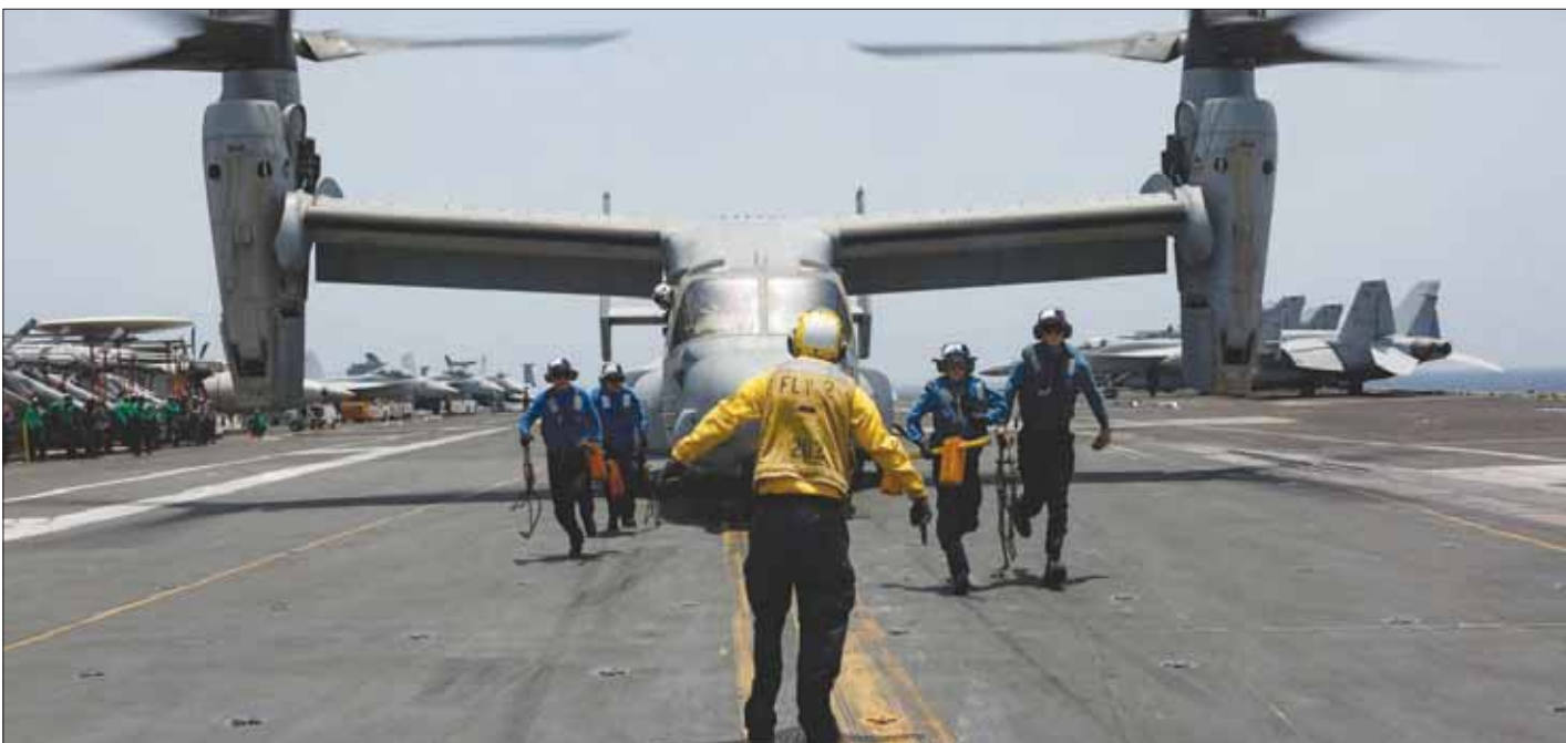
بحارة أميركيون يجهزون لهبوط مروحية على متن حاملة الطائرات «يو إس إس نيمتز» الجمعة

تعزيز قدرات حاملة الطائرات «أبراهام لينكولن»، التي كُلفت بالتصدي لتهديدات إيران، فضلاً عن سفينة «يو إس إس كيرسارج»، وصلت الأسبوع الماضي سفينة «يو إس إس أرلينغتون»، التي تضم على متنها قوات من المارينز وعربات برمائية ومعدات ومروحيات في طريقها إلى الشرق الأوسط. ويقول البنناغون إنه يُراقب عن كثب أنشطة النظام الإيراني وجيشه وشركائه، مشدداً في الوقت نفسه على أن الولايات المتحدة «لا تسعى لنزاع مع إيران». وقال إن مهمة قواته محددة بـ«الدفاع عن القوات والمصالح الأميركية في المنطقة». وقال وزير الدفاع الأميركي بالوكالة باتريك شاناهان، إنه أمر، الأحد، بنشر مجموعة «الينكولن» البحرية الضاربة المكونة من حاملة الطائرات «يو إس إس أبراهام لينكولن» وقطعا بحرية مرافقة لها ومجموعة