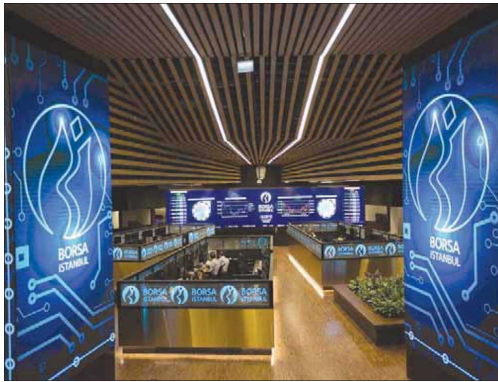
خسر مؤشر بورصة إسطنبول 9% من قيمته منذ مطلع الشهر الحالي

وأوضح التقرير أن شركات توليد الكهرباء تضطر إلى دفع ديون بقيمة 4,3 مليار دولار في السنة، فيما يجب عليها دفع فائدة مضاعفة إذا وصل الدين إلى 2,6 مليار دولار. وأوضح التقرير أن تكاليف الإنتاج تزداد عندما يحدث ارتفاع في سعر صرف الدولار، نتيجة أن توليد الكهرباء يتم الحصول عليه من خلال المدخلات المستوردة، وأضاف الاتحاد، في بيان، أن عدد الشركات التي تم إغلاقها خلال أبريل ارتفع إلى 726 شركة بنسبة زيادة تقدر بنحو 13,4 في المائة، مقارنة بشهر مارس الذي بلغت فيه عدد الشركات المغلقة 640 شركة. وتراجع عدد الشركات التي تم تأسيسها في أبريل بنسبة 20,8 في المائة، مقارنة بالشهر ذاته من العام الماضي.