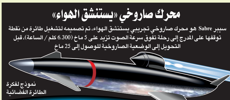
محرك صاروخي «يستنشق الهواء»

سيبر Sabre هو محرك صاروخي تجريبي يستنشق الهواء، تم تصميمه لتشغيل طائرة من نقطة توقفها على المدرج إلى رحلة تفوق سرعة الصوت تزيد على 5 مآح (6.300 كلم / الساعة)، قبل التحول إلى الوضعية الصاروخية للوصول إلى 25 مآح