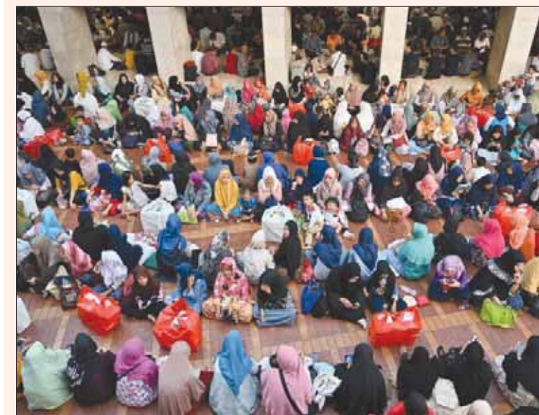
مسلمون يجتمعون لتناول الإفطار بعد يوم صيام في مسجد العاصمة الإندونيسية جاكارتا