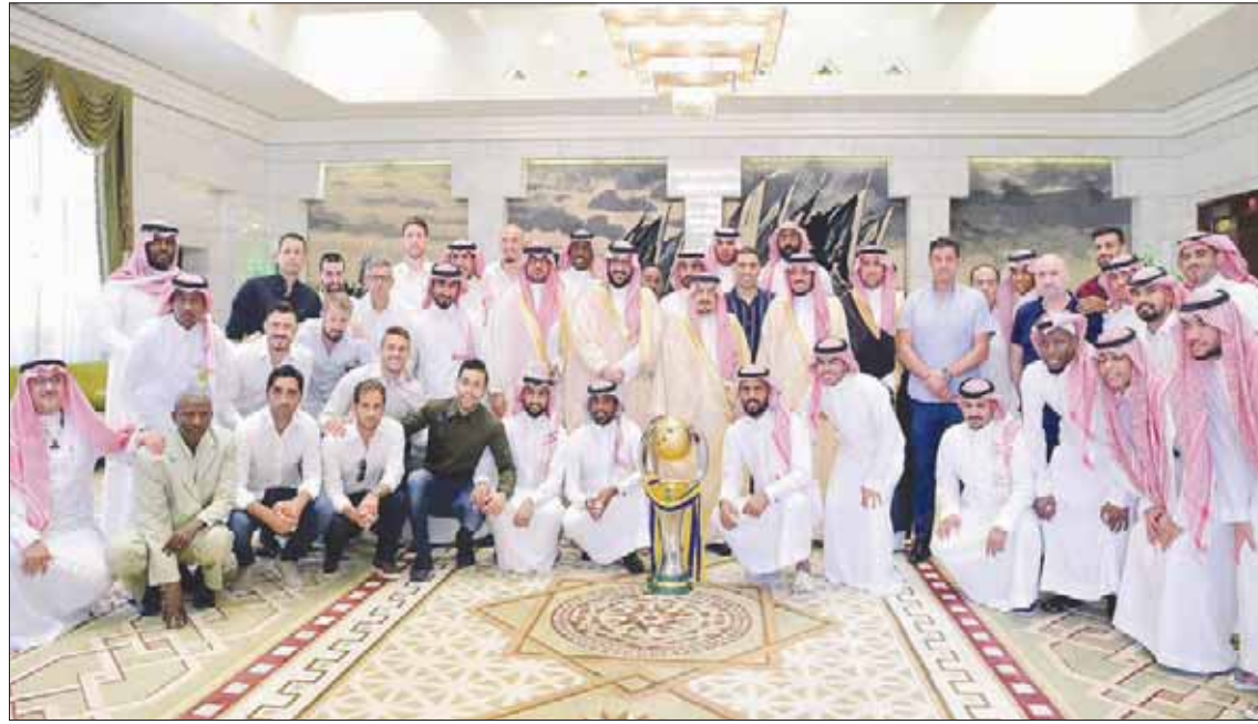
الأمير فيصل بن بندر في لقطة جماعية مع أعضاء فريق النصر

كل الأرقام السابقة في الدوري السعودي، المسجلة باسم الهلال صاحب الإشارة إلى أن النصر في هذه النسخة 70 نقطة، كأعلى معدل نقطي في تاريخ المسابقة، وسجلوا أولية الفوز ببطولة الدوري بعد مشاركة 16 فريقاً.