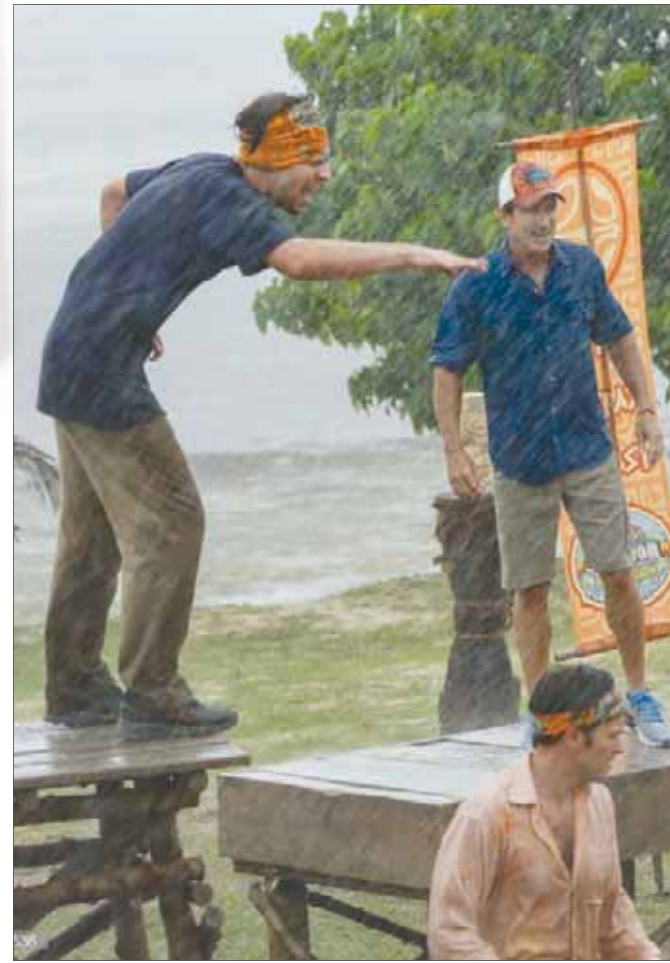
لقطة من برنامج الواقع «سرفايور» الذي اشتهر منذ تسعينات القرن الماضي

وانتهى الأمر بوقف البرنامج والمذيع. وفي حالة أخرى للمذيع نفسها تورطت في خطف أطفال ضمن حلقة عن الاتجار في الأطفال، شاركت من خلاله في جريمة دفع مبالغ مالية لمجرمين شاركوا في خطف أطفال من أجل تسجيل الحوار معهم، وانتهى الأمر بالقبض