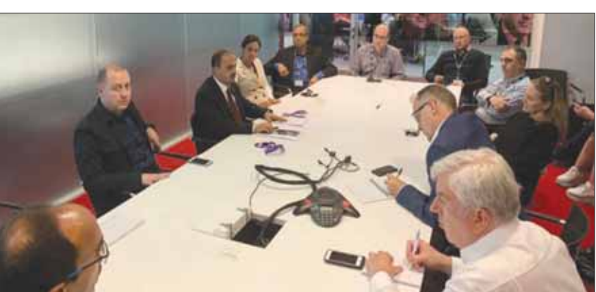
وزير الإعلام اليمني لدى لقائه أعضاء في هيئة تحرير «بي بي سي» في لندن (سبأ)

ما تقوم به الميليشيات من نهب ومصادرة للمساعدات الإنسانية واستغلالها في خدمة مجهودها الحربي وإطالة أمد الحرب والمعاناة الإنسانية. ووفق ما أوردته وكالة الأنباء اليمنية الرسمية (سبأ)، لفت الإيراني إلى أن الحكومة قامت بدفع مرتبات ما يقارب 55 في المائة من موظفي القطاع العام، بداية هذا العام، وحالياً يتم دفع مرتبات 60 في المائة من جميع موظفي الدولة، ومن المتوقع أن تصل النسبة إلى 70 في المائة قبل نهاية العام الجاري،