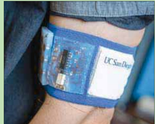
رقعة جديدة تمنح الراحة الحرارية بطاقة أقل

القاهرة، حازم بدر طوّر المهندسون في جامعة كاليفورنيا بمدينة سان دييغو الأميركية، رقعة يمكن ارتداؤها بحيث توفر التبريد والتدفئة الشخصية في المنزل أو العمل، أو أثناء التنقل. ولا تتوفر في أجهزة التبريد والتدفئة الشخصية المتوفرة في الأسواق حالياً مثل المراوح أو الأجهزة التي تملأ بالسوائل فرصة أن يحملها الإنسان في ثقلاته، ولكن الرقعة المبتكرة التي أعلن عنها في دراسة نشرت يوم 17 مايو (أيار) الجاري بدورية «ساينس أوفانسيس»، تتميز بأنها مرنة وخفيفة الوزن ويمكن للإنسان أن