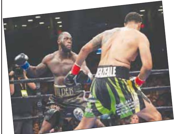
ويلدر (يسار) يوجه ضربه القاضية لبريزيل (أ.ف.ب)

احتفظ الملاكم الأميركي ديونتا ويلدر بلقب بطل العالم للوزن الثقيل حسب تصنيف المجلس العالمي للملاكمة بفوز كاسح على متحديه مواطنه دومينيك بريزيل بالضربة القاضية في الجولة الأولى من المباراة التي أقيمت قبل فجر أمس بتوقيت غرينتش في نيويورك. واستغرق النزال دقيقتين و17 ثانية فقط وكانت كافية لويلدر لإرسال بريزيل أرضاً بلكمة يمينية هائلة، محققاً فوزه الحادي والأربعين في مسيرته، وال40 بالضربة الفنية القاضية. والفوز هو الأسرع لويلدر، مذكراً للعالم بأنه دون شك أفضل ملاكم في الوزن الثقيل لا يزال مستمراً على الحلبات، وأست الانتقادات التي طالته بعد التعامل مع البريطاني تايسون فوري في ديسمبر (كانون الأول) الماضي في نيويورك. ووضع ويلدر الذي وصل الحلبة مطوقاً عنقه بالحزام، مباشرة منافسه في موقف حرج، لكن بريزيل حاول مفاجاته وأزعجه بلكمة من الخلف على الرأس تال عليها إنذاراً. وأدى غيظ بطل العالم إلى قيامه بتوجيه لكمت متلاحقة بكلتا يديه لمجديه فأسقطه