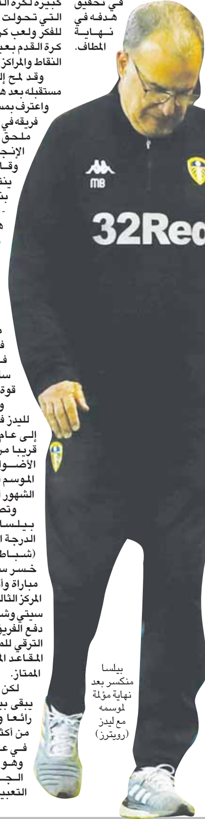
بيلسا متكسر بعد نهاية مؤلمة لموسمه مع ليدز (رويترز)

لكن في كل الحالات، يبقى بيلسا مديراً فنياً رائعاً ويجسد مفهوماً من أكثر المفاهيم غرابة في عالم كرة القدم وهو مفهوم «الفشل الجميل»، إن جاز التعبير.