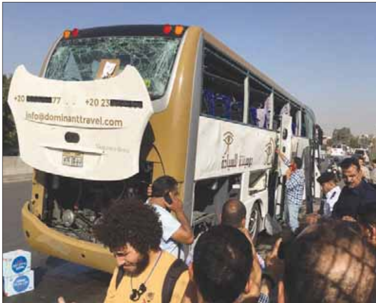
مسؤولو أمن مصريون ورجال شرطة قرب حافلة سياحية استهدفت بتفجير «جسم غريب» في الجزيرة أمس