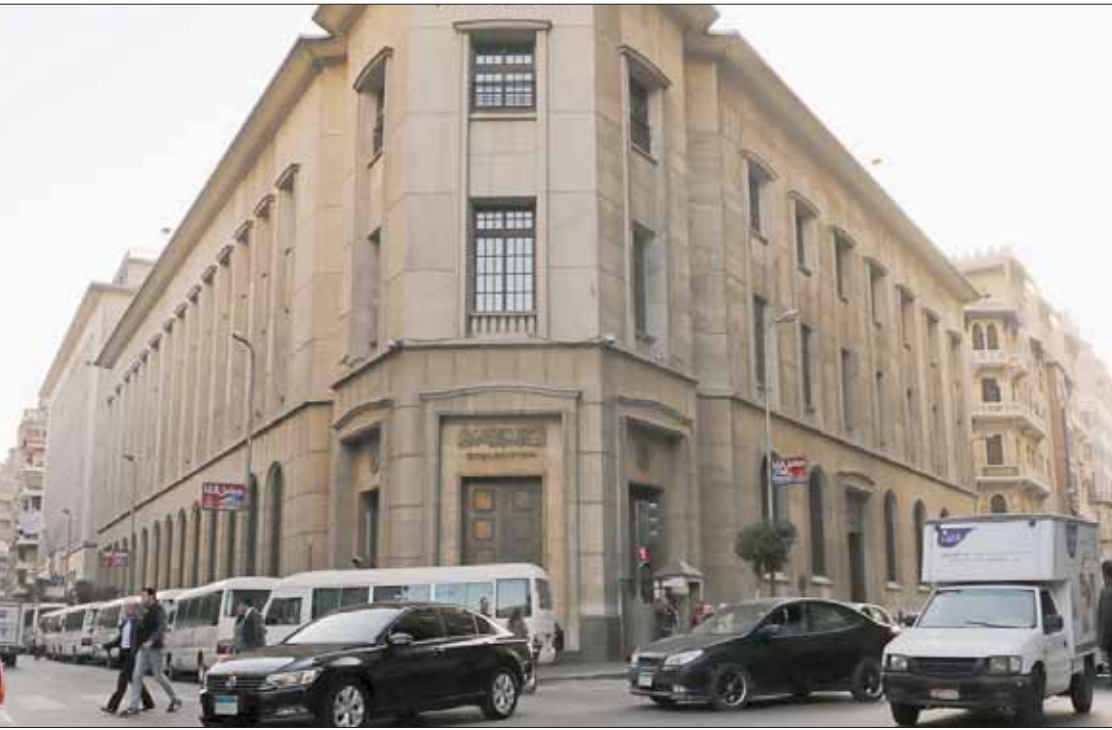
أوقف الكثير من المستثمرين جزءاً من أعمالهم التجارية والصناعية للاستفادة من أسعار الفائدة في مصر

المستمر... وإمكانية الاقتراض أو زيادة الدخل... قال: «المرتب عادة ما ينتهي قبل آخر الشهر بعشرة أيام أو سبعة أيام... ولذلك، تقوم الحكومة بتدبير إنفاق إضافي من خلال سلفة ترد في أول الشهر مع المرتب... أو من خلال فوائد قرشين وضعتهم في البنك». وفي 28 مارس الماضي، أبقى البنك المركزي أسعار الفائدة الرئيسية دون تغيير، ليظل سعر فائدة الإيداع لليلة واحدة عند 15,75 في المائة، وسعر فائدة الإقراض لليلة واحدة عند 16,75 في المائة. وتعتبر أسعار الفائدة تلك عالية. وبيما تتدبر الأسر في مصر من خلال أسعار الفائدة العالية، تضغط بدورها على ميزانية الدولة؛ نظراً لارتفاع تكلفة الاقتراض المحلي؛ إذ بلغ الدين العام المحلي نحو 3,8 تريليون جنيه، فضلاً عن اللجوء للاقتراض الداخلي الذي تخطى 100 مليار دولار. تعرضت الأسر المصرية والحكومة أيضاً لمزيد من الضغوط بعد تعويم العملة في نوفمبر عام 2016، وبينما اتخذت الدولة بعض الإجراءات لضغط ميزانيتها، تتخوف الأسر من تراجع أسعار الفائدة؛ والمتوقع قريباً. يقول الدكتور شريف هنري، خبير الاقتصاد الكلي في مصر: إن أفضل عائد ثابت حالياً يتمثل في فوائده الأوعية الأخرية لدى البنوك، وأمام كل هذا، تعتبر الفائدة في المائة، موضحاً أن ضمان أسعار فائدة ثابتة تصل إلى أكثر من 15 في المائة لمدة ثلاث سنوات، وسط