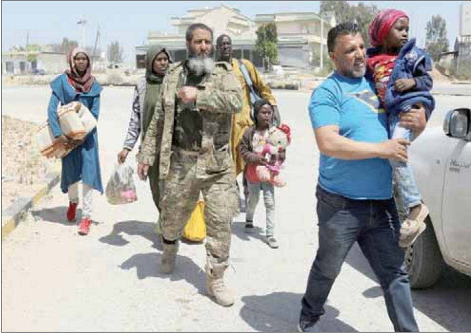
عائلة أفريقية تغادر منطقة السواني بعد ارتفاع وتيرة المعارك أمس

«الجيش الوطني» في وقت سابق هذا العام. لكن رجال القبائل الذين تتغير ولاياتهم ما زالوا يتمتعون بنفوذ في المنطقة الصحراوية قليلة السكان. بدوره، أدان اللواء أحمد المسماري، المتحدث باسم قوات «الجيش الوطني»، استهداف المدنيين بصواريخ جراد والبرجمات بشكل عشوائي على أحياء متفرقة طرابلس، من قبل الميليشيات المسلحة، وتوعد بحاسبة مرتكبها. وقال المسماري في مؤتمر صحفي، عقده بمدينة بنغازي، إن «القصف العشوائي تسبب في تدمير عدد من المنازل في حي الانتصار وأبو سليم في طرابلس».