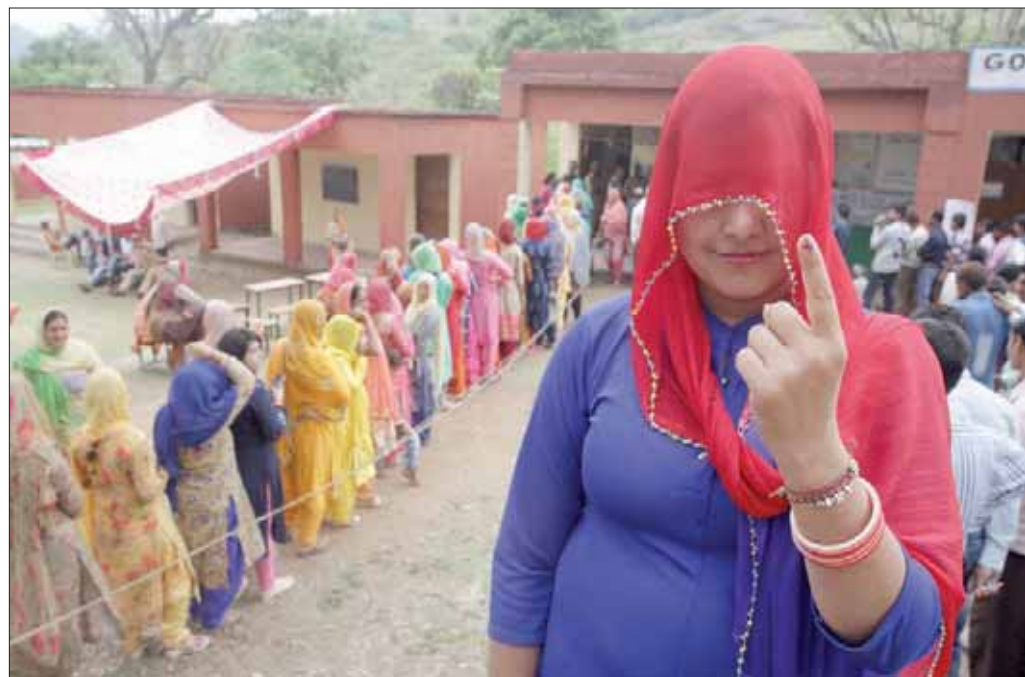
ناخبون مندوب في انتظار الإدلاء بأصواتهم في المرحلة الثانية من الانتخابات العامة (إبأ)

الانتخابات السابقة عام 2014 في ست ولايات شمالية منحة 70 في المائة من إجمالي مقاعها بالبرلمان. وقال، كما نقلت عنه رويترز «لا يمكن أن نتوقعوا أبدا تحقيق ذلك مجددا... والمقاعد التي تقفونها عليكم تعويضها في مكان ما».