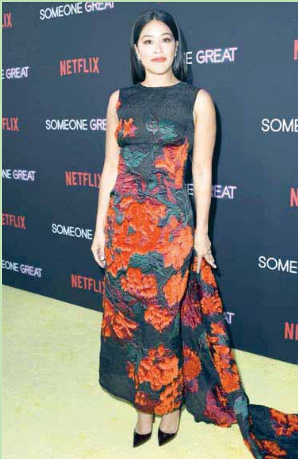
المثلة جينا رودريغز حضرت العرض الأول لفيلم «شخص عظيم» في مسرح آر لايت في هوليوود

كم ضاع من الأزمنة ومن المال ومن البلدان ومن الأرض ومن الكرامات ومن الأجيال. كم ضاع من الأعمار والأمال. ومن الثروات ومن الكرامات. وكم سوف يضيع من المستقبل بسبب ضياعات الماضي المستبد والفاقد والأثني الذي يكره الناس ويخافهم ويعتقد أنهم سوف يطالونه ذات يوم. وهنا فقط كان على حق.