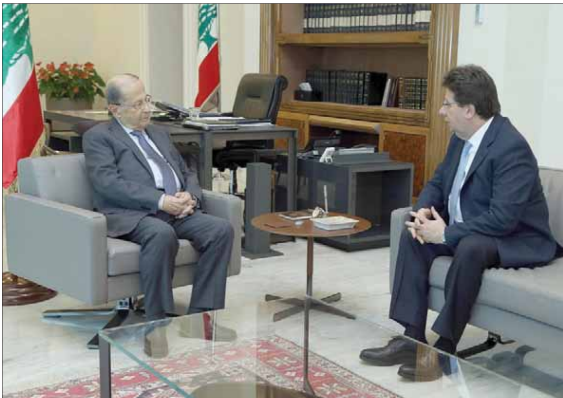
الرئيس ميشال عون مستقبلاً أمس النائب إبراهيم كنعان (اليمين ونهرا)

أكد الرئيس اللبناني ميشال عون إصراره على أن يكون هناك مشروع موازنة في أقرب فرصة، معتبراً أن «كل الأفكار التي يتم تداولها هي مجرد أفكار لا تلزم أحداً، والواجب يقتضي أن يتم طرح مشروع موازنة واضح المعالم ومتضمن للإصلاحات المرجوة، على طاولة مجلس الوزراء، فيجري نقاشها ضمن المؤسسات الدستورية سواء في الحكومة أو في المجلس النيابي»، لافتاً إلى أنه «عندما يبدي كل طرف رأيه بكل شفافية بها، فيتم اتخاذ القرارات المصلحة للبنان وماليتها العامة، من خلال مكافحة الهدر وضبط العجز عبر خطة عامة تعبر عنها هذه الموازنة». ورأى أنه «بغيب هذا المشروع وهذا النقاش داخل المؤسسات الدستورية، فإننا ما زلنا نبعدين عن المطلوب».