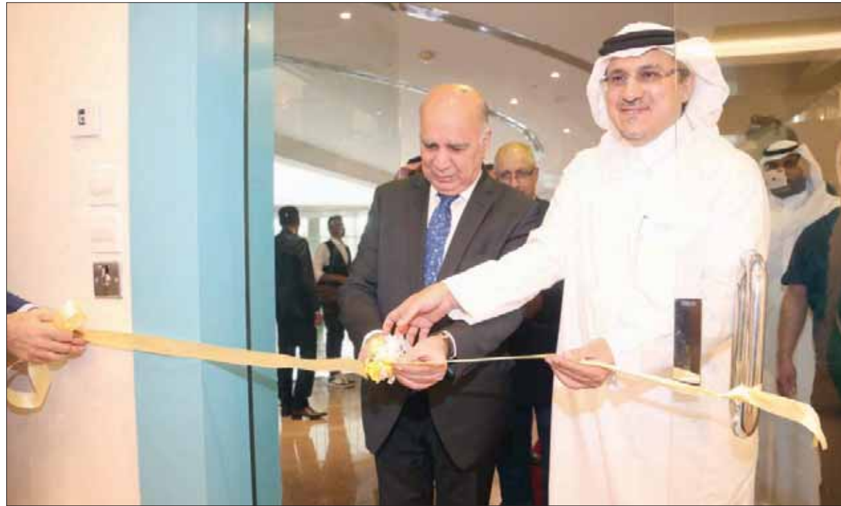
نائب رئيس الوزراء العراقي ومحافظ مؤسسة النقد السعودي

العام 2015، وتخلل السنوات الأربع الماضية عدة مراحل من تحسين العلاقات بين البلدين، كان من ضمنها زيارة وزير الخارجية السعودية للعراق في العام 2017، وزيارة رئيس الوزراء العراقي السابق حيدر العبادي للسعودية مرتين. وشهدت زيارة عادل عبد المهدي رئيس مجلس الوزراء العراقي، للسعودية توقيع 13 اتفاقية في التجارة والثقافة والتعليم والنهضة والكهرباء وغيرها، والتي تخللها عدة لقاءات بين الوزراء بين البلدين.