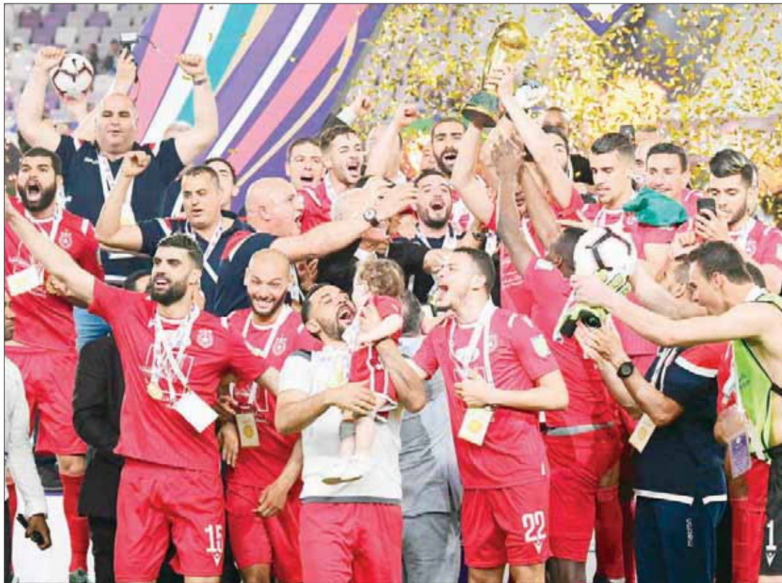
لاعبو النجم الساحلي التونسي لدى تتويجهم باللقب