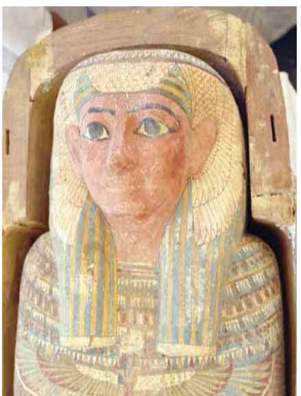
تمثال مكتشف بمقبرة الصف

جزء من متحف شرم الشيخ». ويحتفل العالم بيوم التراث العالمي في 18 أبريل (نيسان) من كل عام، بهدف زيادة الوعي بأهمية التراث الثقافي للبشرية، ومضاعفة الجهود اللازمة لحمايته.