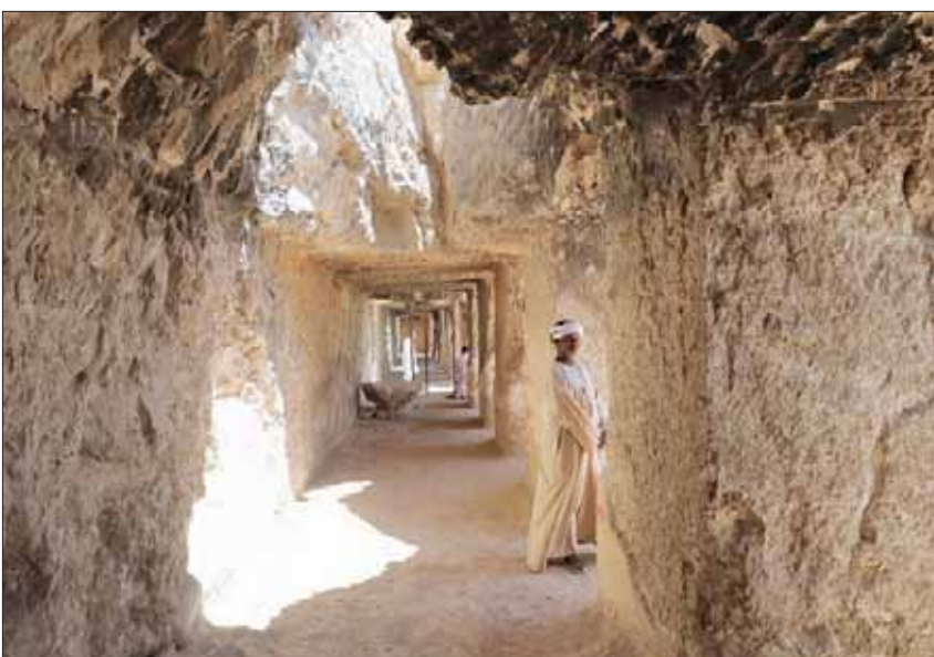
داخل مقبرة الصف بالأقصر

إلى ذلك، أزيح الستار أمس، عن تمثال الملك رمسيس الثاني بعد ترميمه وإعادة نصبه في موقعه الأصلي أمام معبد الأقصر، وقال الدكتور مصطفى وزيرى، الأمين العام للمجلس الأعلى للآثار، إن «البعثة الأثرية المصرية الأميركية المشتركة نجحت في تجميع وترميم وإعادة تركيب ورفع التمثال، ليكون آخر تمثال ضمن 5 تماثيل أخرى للملك رمسيس الثاني، تقف أمام المعبد، حيث انتهت وزارة الآثار من تجميع تماثيل من قبل».