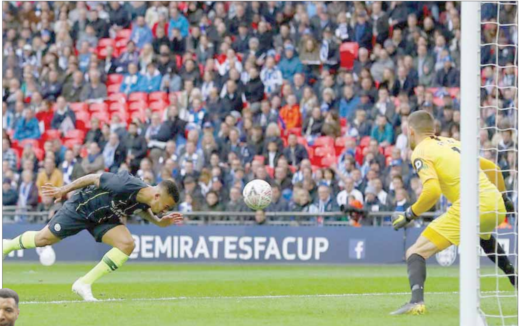
راسية جيسوس ل لاعب سيتي تنهي ما قد يعتبر أجمل هدف جماعي هذا الموسم

لقد أشرنا هنا إلى ثلاثة أهداف جميلة تم إحرازها في نفس