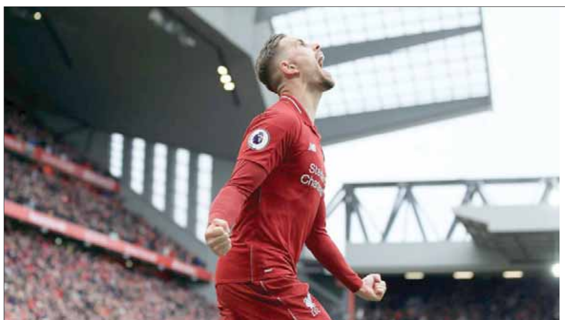
هندرسون لعب دوراً بارزاً خلال الأسابيع الأخيرة في مواصلة ليفربول المنافسة على لقب الدوري الإنجليزي

قد انضم إلى ليفربول في جزء من سياسة مالية رديئة في ظل قيادة كيني دالغليش. وأوشك بريندان روجرز على بيع هندرسون في وقت ما، لكنه بدوره «صاحب القميص رقم 8». في الواقع؛ هذا تحديداً المركز الذي يفصله هندرسون ويتألق فيه بجلاء ويثير إعجاب الجماهير بحماسة. ومثلما أشار اليكس فيرغسون ذات مرة، فإن ثمة أمراً غريباً بخصوص موهبة هندرسون قضى بأنه لن يكون أبداً أكثر اللاعبين تالقاً وليقناً للأنظار، بينما تبرز أخطأه بجلاء في أعين الناس، وحتى لحظات عبقرته تبدو باهتة بعض الشيء. في ساوثهامبتون، نهض هندرسون من على مقعد البدلاء ليحدث تحولاً في مسار المباراة. وكان له الفضل في اختراق صفوف بورتو في إطار بطولة دوري أبطال أوروبا، وكان تدخله هو ما أعان في فتح صفوف تشيلسي. ورغم جلوسه على مقعد البدلاء مع المنتخب الإنجليزي، فإنه شارك أمام مونتيديو دور «صاحب القميص رقم 8» ليكون له الفضل في خلق الهدفين الرابع والخامس عبر تمريراته السريعة نحو الإمام.