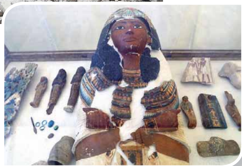
قطع أثرية فريدة تم اكتشافها بمقبرة الصف

ختم ملك مصر العليا، بالإضافة إلى مناظر أخرى لصيد الأسماك والطيور والتي تظهر محتفظة بألوانها الزاهية، وبقايا منظر لحملة القرايين ومناظر للوليمة، والموكب الجنائزى. وقالت الباحثة الألمانية «فردريكا كامب»، المسؤولة عن تسجيل المقبرة، إن المقبرة يتقدمها فناء كبير جداً يعرض 55 متراً يؤدى إلى مقبرة صف بها 18 مدخلاً وبذلك تكون المقبرة هي أول مقبرة في جبانة طيبة يوجد بها هذا العدد من المداخل، حيث إن أقصى عدد وجد في مقابر الجبانة يصل إلى ما بين 11 أو 13 مدخلاً». لافتة إلى أن «هذه المقبرة تعد أول مقبرة من نوعها يكون عدد مداخلها زوجياً وليس