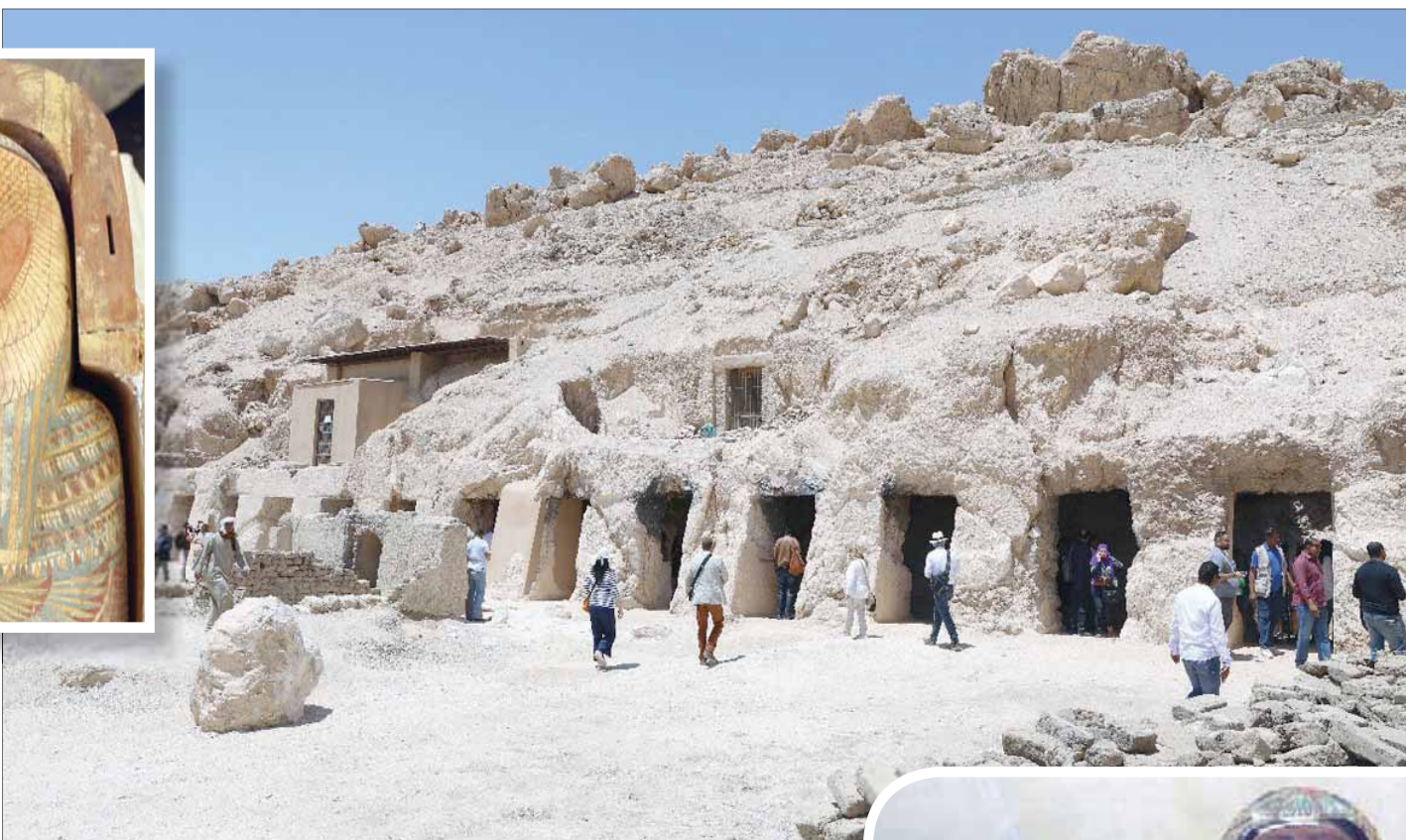
مقبرة الصف بالأقصر كما تبدو من الخارج

في السياق نفسه، نظم متحف الشبخ المصري بشارع المعز في القاهرة الفاطمية، احتفالاً أمس، تضمن معرضاً للحرف التراثية، والأزياء، وبعض الفقرات الفنية، في إطار الدورة الثالثة من مهرجان التراث المصري، وقالت إلهام صلاح رئيس قطاع المتاحف، إن «احتفال هذا العام تم تخصيصه للتراث الأفريقي، بمناسبة رئاسة مصر للاتحاد الأفريقي، وإعلان 2019 عام أفريقيا في مصر».