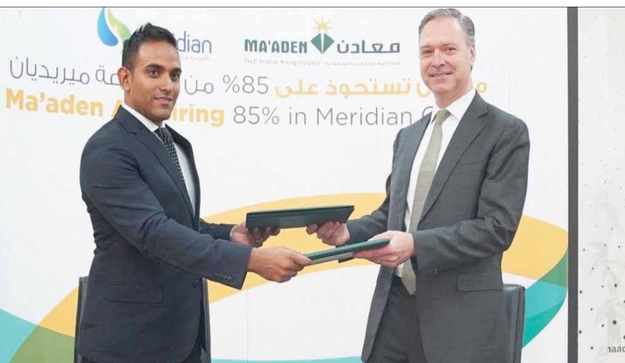
تبادل الاتفاقية التي بموجبها تستحوذ معادن السعودية على 85% من أسهم «ميرديان» الأفريقية (الشرق الأوسط)

المشروعات والمجمعات الصناعية المتكاملة، في كل من مدينتي رأس الخير ووعد الشمال من خلال تحالفات دولية ضخمة حيث تبلغ الطاقة الإنتاجية 6,15 مليون طن من الأسمدة الفوسفاتية، وأعلنت مؤخراً عن مشروعها الثالث للأسمدة الفوسفاتية الذي سيضيف ثلاثة ملايين طن للطاقة الإنتاجية، ما يضع معادن ضمن أكبر ثلاثة منتجين ومصودرين للأسمدة الفوسفاتية في العالم ويجعل منها لاعباً رئيسياً في تعزيز الأمن الغذائي العالمي.