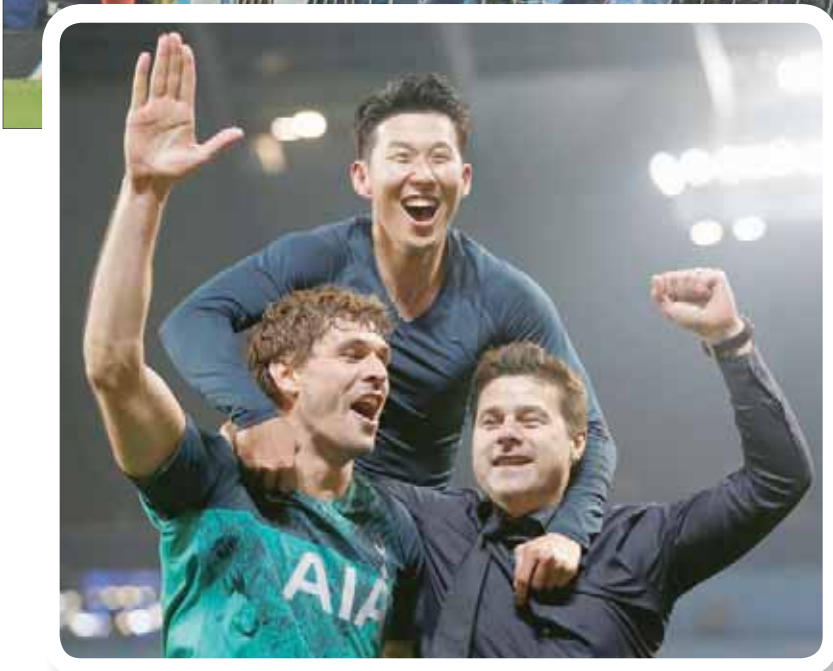
بوكيتينو ويورنتي وسون وفرحة التأهل

ويحتل فريق المدرب ماوريسيو بوكيتينو المركز الثالث، وله 67 نقطة متقدماً بنقطة على أرسنال وتشيلسي وثلاث نقاط على مانشستر يونايتد في صراع رياضي على آخر مركزين في المربع الذهبي.