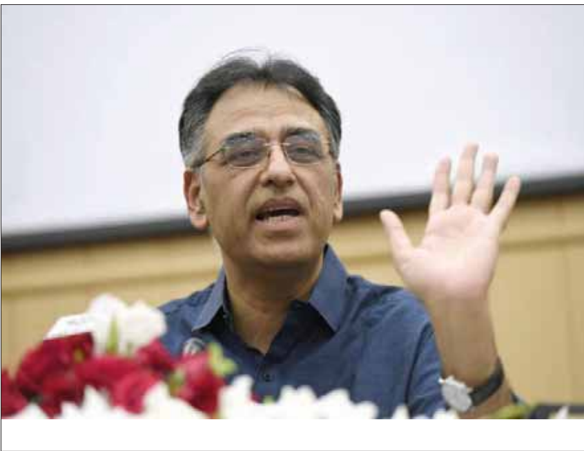
استقالة وزير المالية المقرب من عمران خان بعد العودة من جولة مفاوضات مع صندوق النقد الدولي

ومما يؤكد الخلافات بين المؤسسة العسكرية والحكومة المدنية أن قرار إقالة أسد عمر لم يكن مدرجاً على جدول أعمال الحكومة. وقالت وزيرة حقوق الإنسان في الحكومة الدكتورة شيرين مزارى: «كُنْتُ في اجتماع، ودخلت وكان أسد عمر وزيراً للمالية في الاجتماع، لكن بعد خروجي علمت أنه أقبل من منصبه. لا أدري ما الأسباب وراء ذلك».