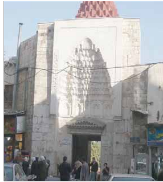
البيمارستان النوري بدمشق

مثل حريق نوتردام وذلك حسب ما نقلت صحيفة «ذا غارديان» عن جون ريستفسكي، المدير التنفيذي لشركة «سايارك» التي وثقت النماذج الـ 17. وحسب تقرير الصحيفة، فقد خضعت نوتردام للمسح التقني منذ أعوام قام بها فريقان من