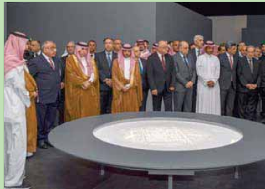
رئيس مجلس الوزراء العراقي عادل عبد المهدي خلال زيارته معرض «مدن دمرها الإرهاب» في الرياض