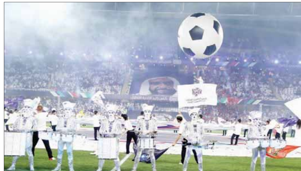
جانب من الاحتفالية بين شوطي المباراة

اليوم.. الأهلي يسعى لتضميد جراحه على حساب الوحدة