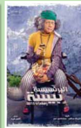
مسلسل «البرنمجة بيسة»

بالإضافة إلى «هوجان» للفنان محمد عادل إمام. وبعيداً عن قنوات الشركة المتحدة للخدمات الإعلامية، هناك منافسة شرسة تخوضها قناة mbc مصر بـ 5 مسلسلات حصرية، أبرزها «ولد الغلابة» الذي يعود فيه الفنان أحمد السقا لتقديم شخصية الصعيدي، بعد أن تلقى فيها من قبل في فيلم «الجزيرة»، وبعيداً عن أحمد السقا تراهن mbc مصر على مسلسلات أبطالها من