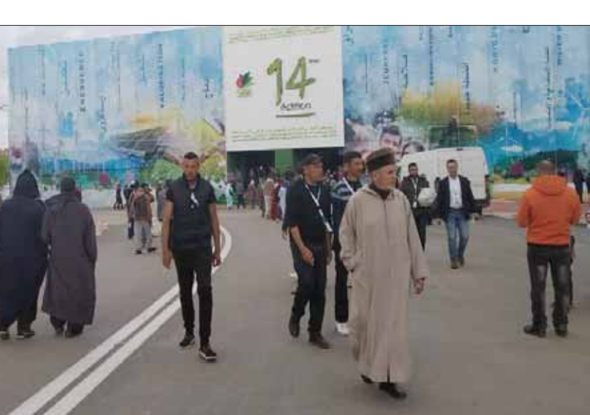
جانب من معرض مكتاس الدولي للفلاحة أمس (الشرق الأوسط)

مكتاس، لجنس متقن بلغت الاستثمارات الإجمالية في قطاع الزراعة المغربي خلال السنوات العشر الأخيرة 108 مليارات درهم (11,5 مليار دولار)، ساهمت فيها الحكومة بحصة 38% والقطاع الخاص بحصة 62%. حسب حصيلة تنفيذ المخطط الأخضر بين 2008 و2018، التي قدمتها وزارة الفلاحة المغربية، أمس، في مدينة مكتاس خلال الملتقى الدولي للفلاحة في المغرب. وأشارت بيانات وزارة الفلاحة إلى قيام الحكومة خلال هذه الفترة بتخصيص 136 ألف هكتار من الأراضي التابعة للملك الخاص للدولة لصالح القطاع الخاص عن طريق عقود شراكة، والتي أنجز عليها 1632 مشروعاً فلاحياً باستثمار إجمالي ناهز 56 مليار درهم (5,7 مليار دولار). كما تم توزيع 1303 آلاف هكتار إضافية من الملك الخاص للدولة على الفلاحين الصغار، والتي استفاد منها 21 ألف فلاح. ومكن المخطط الأخضر من زيادة الإنتاج الداخلي الخام للطعام من 125,4 مليار درهم (13,2 مليار دولار) في 2018، مقابل 70 مليار درهم (7,5 مليار دولار) في 2008، وارتفعت حصته من الناتج الخام الداخلي الإجمالي