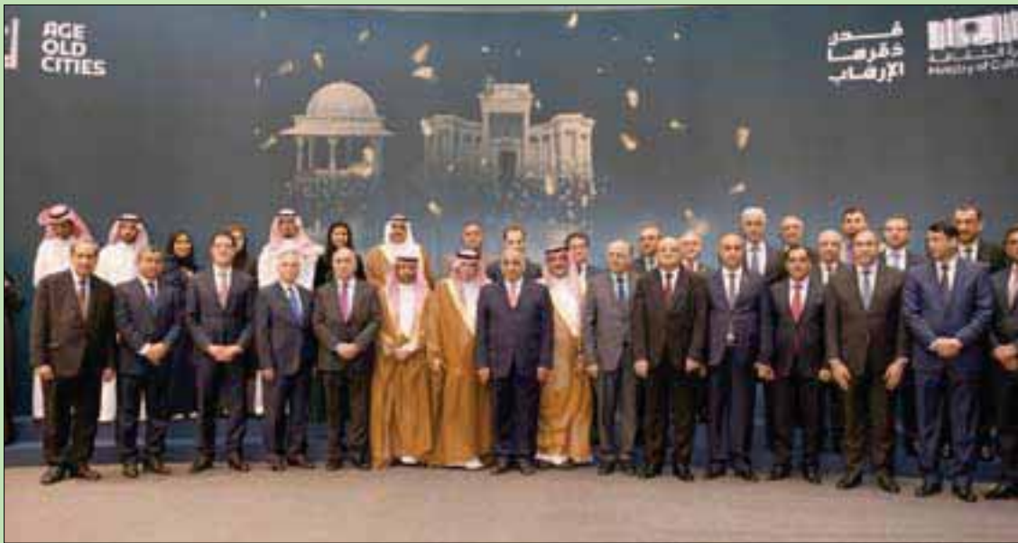
صورة جماعية للوفد العراقي