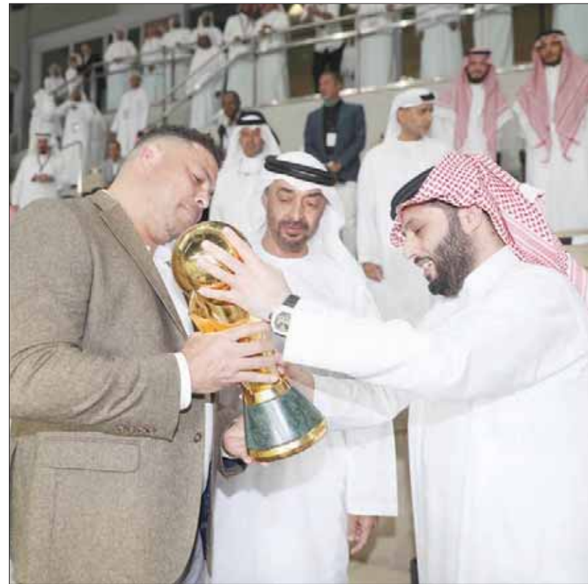
الشيخ محمد بن زايد يستمع لشرح عن تصميم الكأس من تركي آل الشيخ رئيس الاتحاد العربي ويظهر النجم البرازيلي المعتزل رونالدو

الهلال قبل أن يتعرض لإعاقة من الدفاع صابر بن عزيزة، تقدم لها المخصص الفرنسي غوميز وأرسل الحارس في زاوية وركن الكرة في زاوية أخرى، وحاول محمد الشلهوب استغلال مهارته في التسديد وأطلق قذيفة بعيدة المدى مرت بجوار القائم.