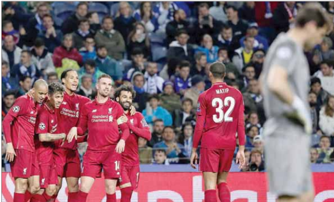
ليفربول يتخطى بورتو ويواجه برشلونة في المربع الذهبي