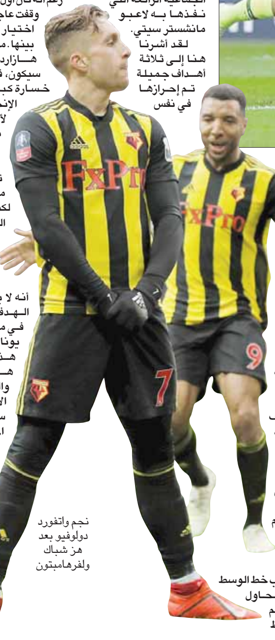
نجم واتفورد دولوفيو بعد هز شيك ولغرهامبوتون

بعد مثالاً رائعاً للعمل الجماعي، في البداية، مقرر إيمريك لابورت رائع بشكل رائع من منتصف الملعب باتجاه بيرناردو سيلفا ناحية اليمين، لكنهم لم يتوقعوا بهذه الطريقة المثقفة والمفاجئة من لاعب خط الوسط المدافع. ولم يحاول سيلفا تسلم الكرة والاحتفاظ