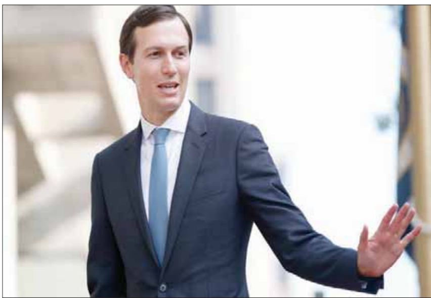
جاريد كوشنير

الفلستيني من خلال عرض تلك الصفقة بعد شهر رمضان المبارك، في درشة علنية لن تكون بتقديرنا وفقاً للمعطيات السياسية فإن إدارة ترمب سستكمل تنفيذ الشق السياسي من الصفقة من خلال تشجيع إقامة كيان فلسطيني منفصل في قطاع غزة». وتابعت أن «فريق ترمب يتسابق بالإدلاء بمزيد من التصريحات والمواقف بشأن ما سُمي بصفقة القرن لخلق ضجيج مثبوق للمشهد المنتظر كما يدعون، كان آخرهم كوشنير مُعلنًا اشتغاله في تحضير هدايا العيد للشعب