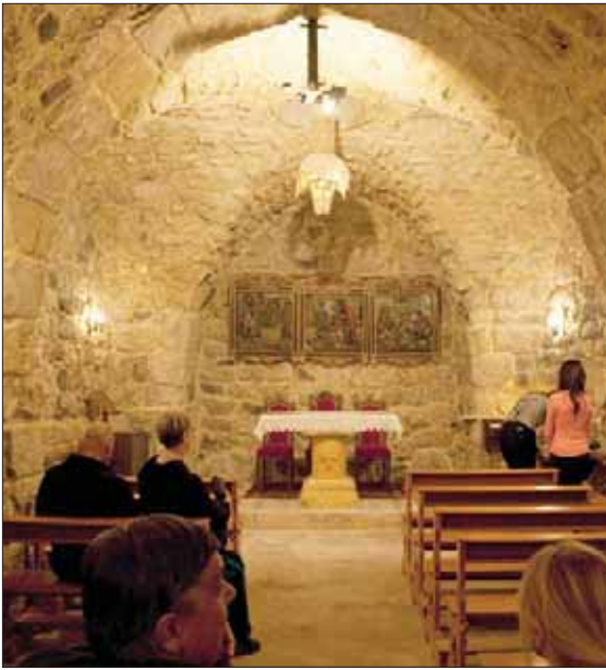
كنيسة حانانيا بدمشق

المهم في التقنية أنها أيضاً تمنح الفرصة للجولوجيين للاطلاع على مبانٍ صعب دخولها وفحصها، وتضم الملفات الجديدة مواقع مختلفة من سوريا أعدها مهندسون محليون تم إمدادهم بوسائل تقنية حديثة من قبل الشركة للمساهمة في عملية المسح الرقمي. تشمل تلك المواقع كنيسة القديس حنانيا بدمشق، التي وإن كانت لم تتعرض للتدمير في الحرب الدائرة، فإنها تضررت من جراء فيضان حديث وتم مسحها تحسباً لأي ضرر قد يحدث مستقبلاً.