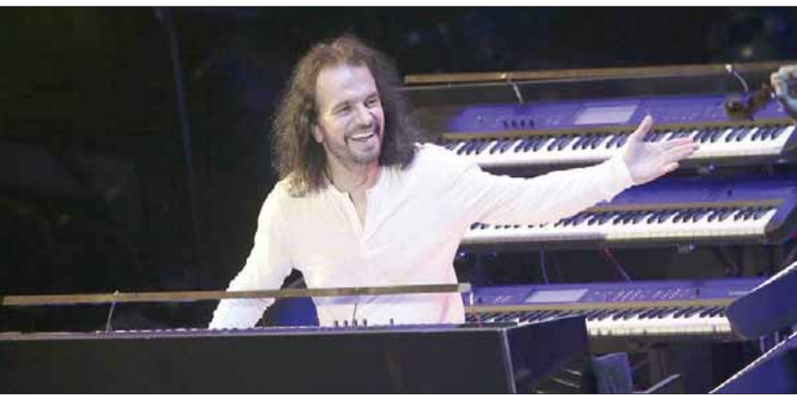
ياني عازف البيانو والموسيقي العالمي اليوناني الأصل

خلالها اغاني اليوم الجديد للمرة الأولى إلى جانب باقة من أجمل أغانيه الخاصة: «ما وديتك» و«نامي عصدي» و«بدي ياها» التي حققت نجاحاً واسعاً، ومع فريق «ستارز 80» الفرنسي سيموني اللبنانيون أمسية غنائية تعبق بالنوستالجيا والرومانسية على أغانٍ أسطورية واشتهرت في الثمانينات، والمعروف أن فريق «ستارز 80» المؤلف من 13 فرقة أجنبية يحصد نجاحات كبيرة منذ سنوات على مسارح فرنسية وعالمية، إذ تجاوز عدد رواد حفلاته 3 ملايين ونصف المليون شخص وذلك على مدى 11 سنة من إحيائه الحفلات المتتالية، وعلى أنغام الحان الرهبانية وبمشاركة فنانين لبنانيين وأجانب اشتهروا بها أمثال ليزا سيمون سيستمنت جمهور «أعياد بيروت» بحفل موسيقي يقام في 19 يوليو تحت عنوان «بيروت»، أمسا عشاق الفنانة اليسا وهي «ستار سيستم» و«توبو تو سي» و«برودكشن فكتور». وتفتتح أولى ليالي المهرجان في 11 يوليو المقبل وداثماً على مسرح الواجهة البحرية وسط بيروت مع الفنان وائل كفوري فيخفي بذلك حفلة الفني الوحيد في العاصمة ثقافياً وفنياً إلى العالمية. كانت لجنة «مهرجانات أعياد بيروت» قد أطلقت برنامج حفلاتها في مؤتمر صحافي عُقد في فندق فينسيا، وحضره كل من وزير السياحة أفيديس كيدانين، ووزير الثقافة محمد داود، إضافة إلى بعض