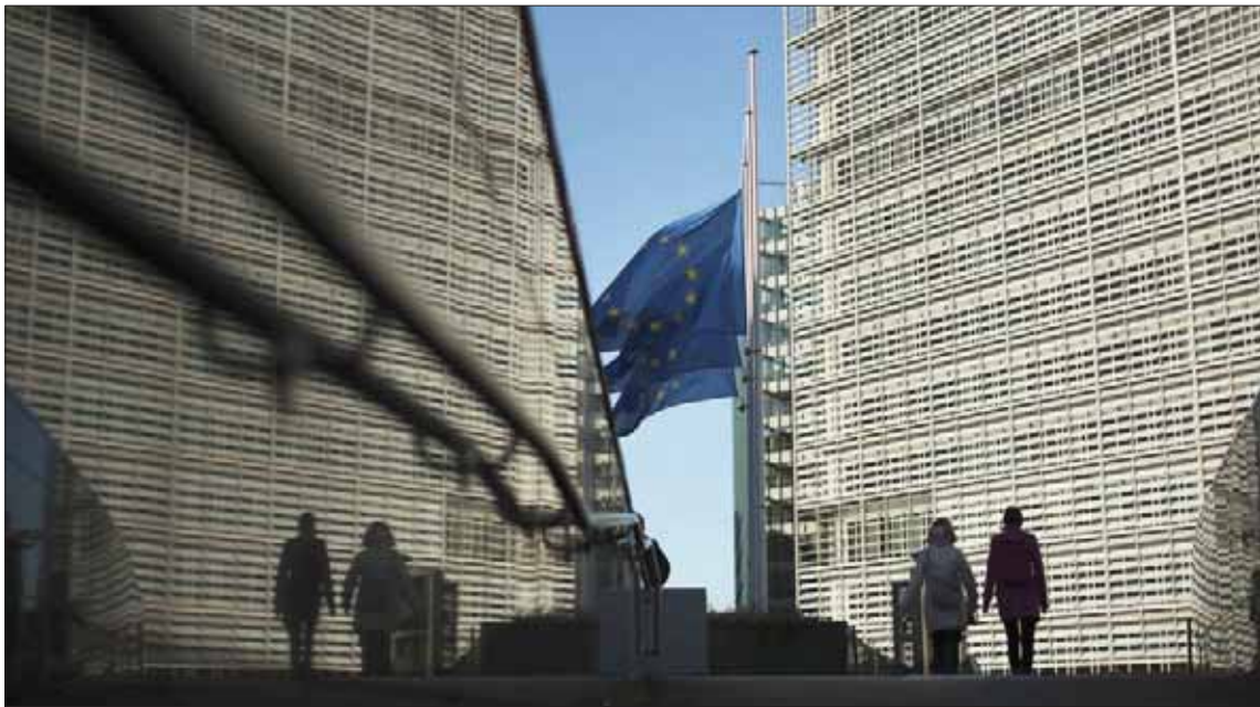
هددت إدارة ترمب في وقت سابق بفرض رسوم تستهدف سلسلة منتجات بينها المرحيات وقطع الطائرات وجبة «غاودا» (أ.ب)

وزادت الأنشطة الجديدة بالكاد في أبريل، حيث ارتفع المؤشر الفرعي الخاص بها إلى 50,6 نقطة مقابل 50,5، ليظل