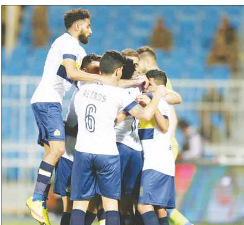
فرحة نصرارية بعد أحد الأهداف في مرمى الفتح (رابطة دوري المحترفين)

وفي بريدة، يبحث الرائد عن تأمين موقفه على سلم الترتيب بوقف الأرجنتيني خوان براون منذ توليه الإدارية الفنية أخيراً، حيث تعرض لخسارتين على التوالي من النصر والحزم توقف معها رصيده النقطة عند 31 لكنه حافظ على مركزه العاشر، ويدرك أصحاب الأرض والجمهور أن فريق أحد سيدخل دون ضغوط بعدما تأكد هبوطه في الجولة الأخيرة.