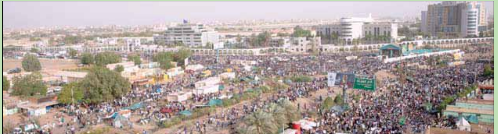
حشود من السودانيين تتظاهر أمام مقر قيادة الجيش في الخرطوم أمس

وهيئة تشريع، ومجلس رئاسي مدني، ومحاربة الفساد وإصلاح الاقتصاد، وإعادة هيكلة جهاز الأمن القومي. منذ صباح أمس، توافد السودانيون على شكل أمواج تضم قطاعات مهنية وطلابية، كل منها يحمل لافتات تطالب بإسقاط النظام وتسليم السلطة للمدنيين. وقالت أحلام عبد