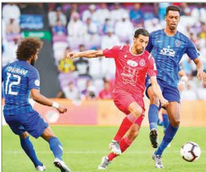
المواجهة شهدت إثارة كبيرتين بين الطرفين

وجاءت بداية اللقاء دون خطورة تذكر على مرمى الفريقين، واعتمدوا على تناقل الكرات القصيرة بين أقدام اللاعبين في محاولة للسيطرة على منطقة المناورة، والبحث عن ثغرات الدفاعية، وجاء أول تهديد