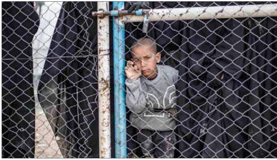
طفل في مخيم الهول شمال شرقي سوريا حيث تقيم عائلات «داعش» ومدنيون فروا من المعارك

دعا بانوس مومسيس، منسق الأمم المتحدة الإقليمي للشؤون الإنسانية، المعنى بالأزمة السورية، الحكومات، للمساعدة في حل أزمة مصير 2500 طفل أجنبي، محتجزين بين 75 ألف شخص في مخيم الهول بشمال شرقي سوريا، بعد الفرار من آخر معقل لتنظيم «داعش».