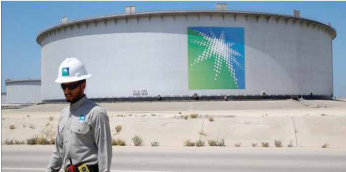
تلتزم السعودية باتفاق تخفيض النفط بين «أوبك» ومنتجين مستقلين وتقوده

دولار للبرميل. وبلغت العقود الآجلة لخام غرب تكساس الوسيط الأميركي 63,62 دولار للبرميل، منخفضة 14 سنتاً أو 0,2 في المائة. وقالت إدارة معلومات الطاقة الأميركية، الأربعاء: إن مخزونات النفط الخام في الولايات المتحدة انخفضت 1,4 مليون برميل في الأسبوع المنتهي في الثاني عشر من أبريل (نيسان). مخالفة توقعات المحللين التي كانت أشارت إلى زيادة قدرها 1,7 مليون برميل. وانخفضت مخزونات البنزين بمقدار 1,2 مليون برميل، في حين أشارت توقعات المحللين في استطلاع لـ«رويترز» إلى انخفاض قدره 2,1 مليون برميل. وتراجعت مخزونات نواتج التقطير، التي تشمل الديزل وزيت التدفئة، بمقدار 362 ألف برميل، بينما كانت التوقعات تشير إلى هبوط قدره 846 ألف برميل، بحسب بيانات إدارة معلومات الطاقة. وتلقت الأسعار دعماً هذا العام من اتفاق منظمة البلدان المصدرة للبترول (أوبك) وحلفائها، من بينهم روسيا، على خفض إنتاجهم 1,2 مليون برميل يومياً. كما انخفضت إمدادات الخام من السعودية أكثر بسبب فرض الولايات المتحدة عقوبات على فنزويلا وإيران عضوي «أوبك».