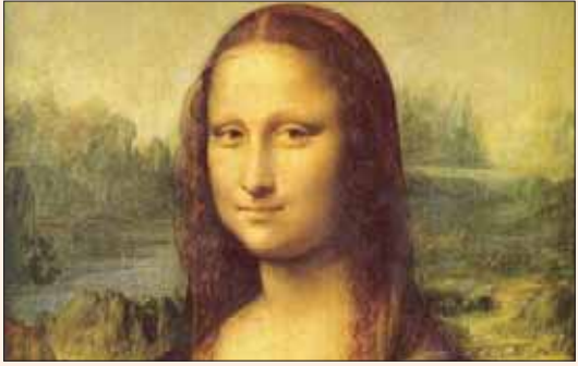
لوحة «الموناليزا» الشهيرة