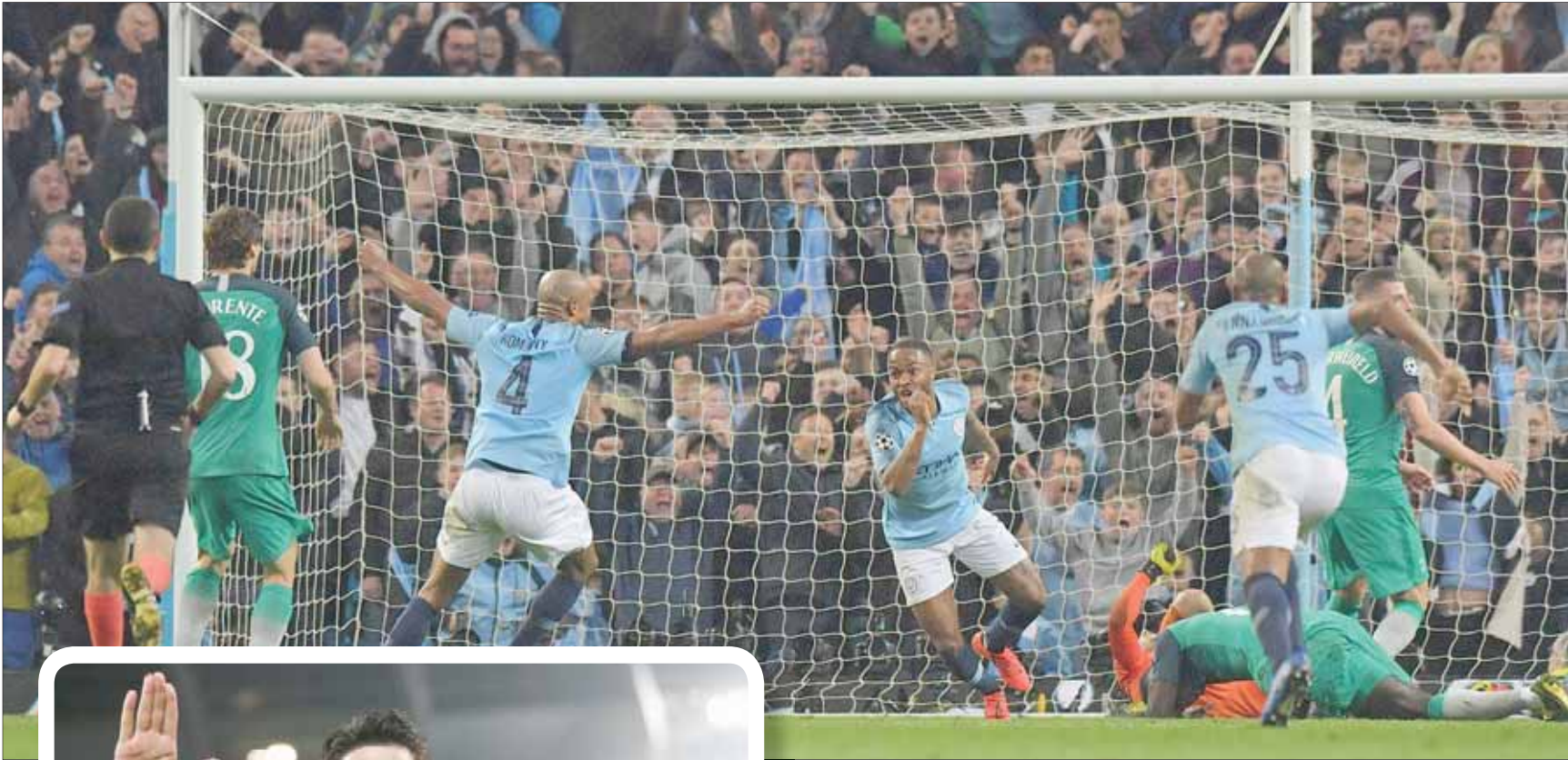
ستريلينج يحتفل بهدف سيتي الخامس الذي لم يحسب

وحصل توتنهام على إشادة من لاعب إنجليزي دولي سابق أصبح نائداً تلفزيونياً. وقال ريو فيرديناند مدافع مانشستر يونايتد السابق، عبر «تي سي سبورتنج»: «إنهم في المباراة للفوز بها. الأمر