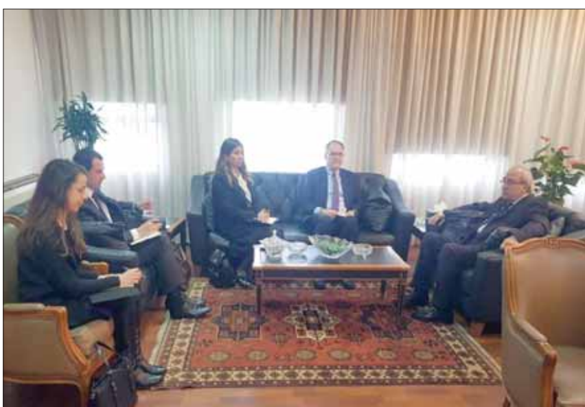
وزير العدل البرت سرحان خلال اجتماعه مع رئيس قلم المحكمة الدولية والوفد المرافق أمس

جميع جوانب إدارة المحكمة، بما في ذلك الميزانية والتمويل والموارد البشرية وتوفير الأمن، كما تشمل مسؤولياته أيضاً النواحي التنظيمية لعمل لجانها إلى لبنان، حتى حل في بيروت رئيس قلم المحكمة داريل مانديس، وأجرى لقاءات شملت مرجعات سياسية وقانونية ودبلوماسية، أختتمها بزيارة وزير العدل الجبرت سرحان، أمس، الذي بحث معه في مسار المحكمة والتعاون القائم بينها وبين السلطات اللبنانية، فيما يتحزق المسؤولون اللبنانيون من وفود المحكمة موعد الحكم في قضية اغتيال رئيس الحكومة الأسبق رفيق الحريري، وصدور قرارات اتهامية جديدة في جرائم الاغتيال المتلازمة مع قضية الحريري.