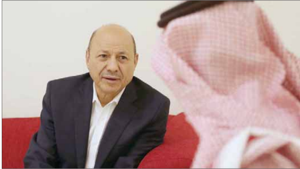
العلمي خلال حديثه مع «الشرق الأوسط»

المحررة، وعودة المؤسسات التنفيذية وموظفيها إلى العاصمة المؤقتة عدن وغيرها من القضايا التي نعتقد أنها تساهم في تحسين أوضاع شعبنا اليمني ورفع المعاناة عنه.