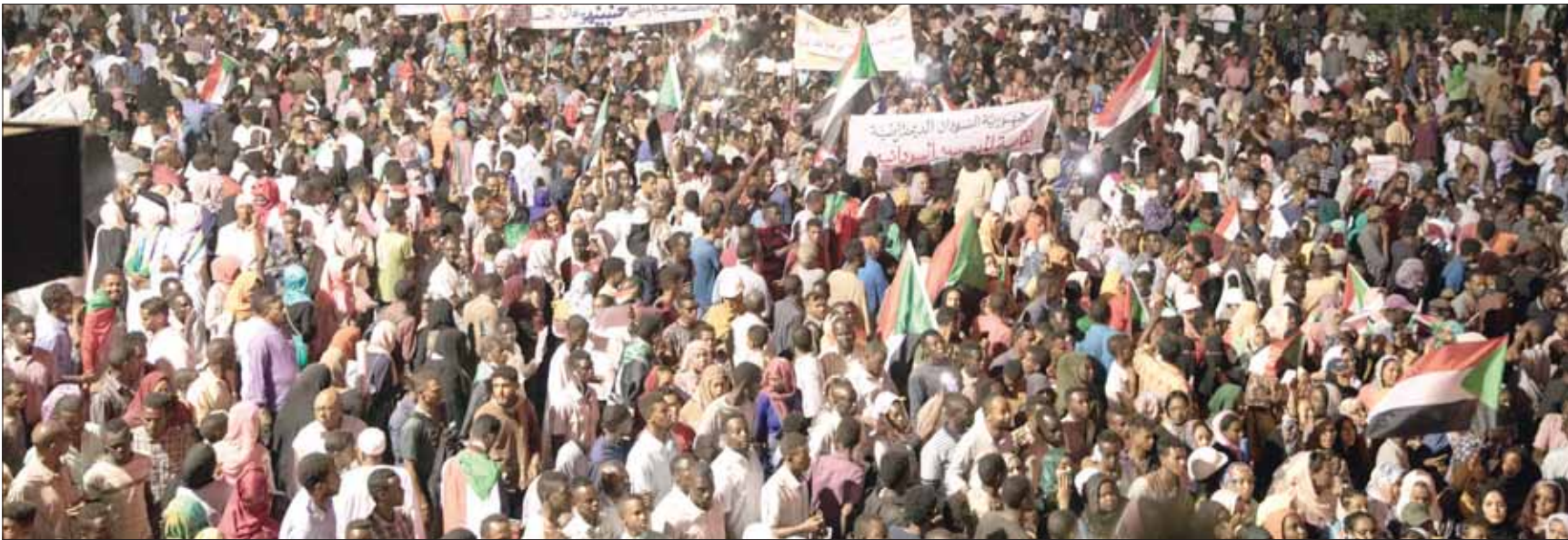
جماهير حاشدة أمام مقر قيادة الجيش السوداني أمس

نغار الميدان، ولن نكرر تجربة ثورة أبريل 1985، فبعد أن أسقطنا نظام النميري عدنا لبيوتنا، فاجهض المجلس العسكري الثورة»، وتابع: «ترفع الاعتصام بشرط واحد، تحقيق مطالبنا بحاسبة النظام المخلوع وزموره، واستعادة الدولة من الكيزان»، وتسليم السلطة لحكومة مدنية بصلاحيات كاملة». وتراماً مع اعتصام الخرطوم، خرجت مظاهرات ومواكب في عدد من مدن السودان، اتجهت كلها لمقرات الجيش في تلك المدن، وشملت شمال كردفان ومواكب للمعلمين والمحامين، فحما شهدت ولاية النيل مواكب مشابهة، ومثلها الفاشر في الغرب وبورتسودان في الشرق.