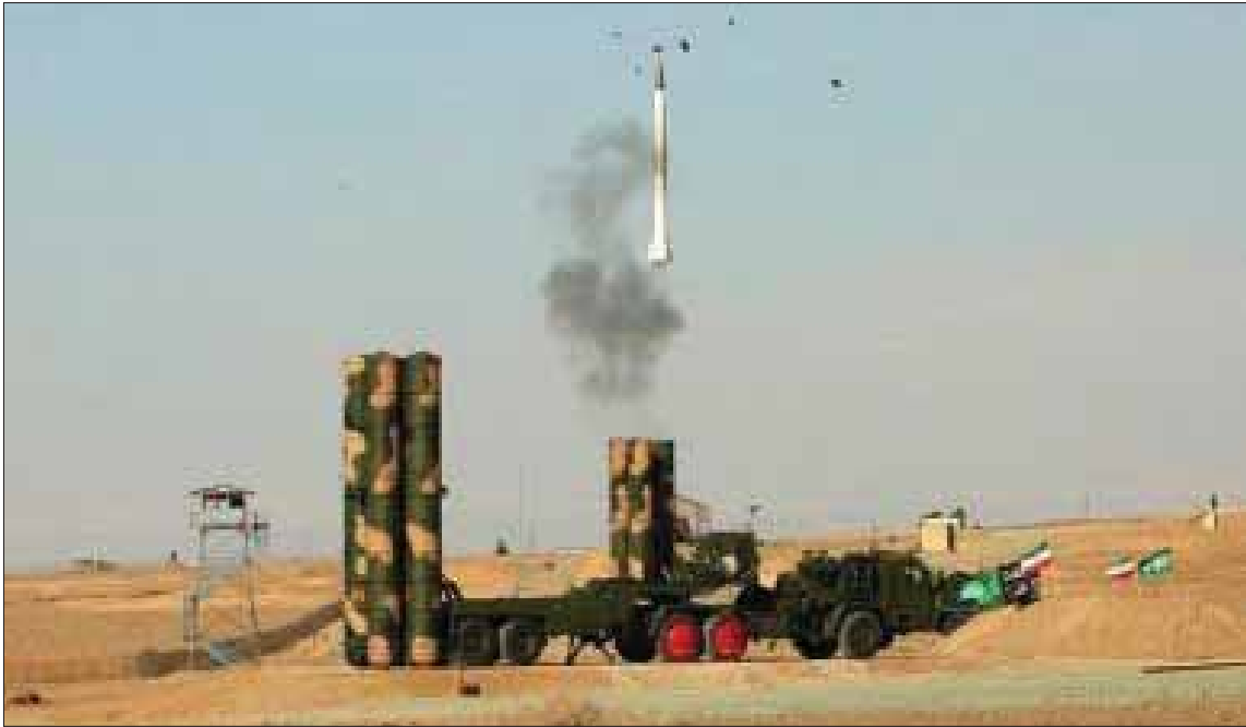
منظومة من صواريخ «إس 300»

وفي الوقت ذاته، أجرى مناورات متفاجئة بالتعاون مع جهازَي الشاباك (المخابرات العامة) وشرطة حرس الحدود وقوات خاصة أخرى تحاكي وقوع عمليات خطف إسرائيليّين في الضفة الغربية وتحرير الرهائن. وقد شارك فيها عدد كبير من جنود الاحتلال سيجارويها تصعيد كثيرة في الضفة، مع التركيز على الدروس المستفادة من عملية البرتامج الجديد متعدد السنوات،