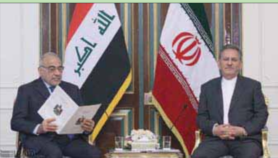
نائب الرئيس الإيراني ورئيس الوزراء العراقي على هامش مباحثات أمس

«أرسلت قوات استشارية، يطلب من الحكومة العراقية، لدعم السيادة والاستقرار وتنمية العراق»، مشيراً إلى أن «إيران تعتبر العراق جسراً للتعاون مع الدول التي تحترم السيادة العراقية».