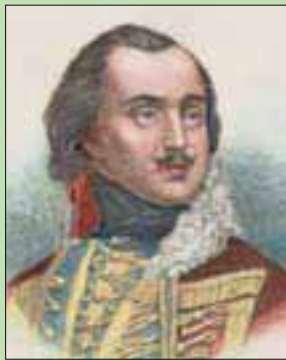
الجنرال كاريمير بولاسكي

سافانا وتوفي بعدها بأيام. وأصدر الرئيس الأمريكي دونالد ترمب بياناً العام الماضي، أعلن فيه يوم 11 أكتوبر (تشرين الأول) يوم ذكرى الجنرال بولاسكي. وتنفق السمات الأخرى للهيكل العظمي، بما في ذلك القامة والعمر وبنية الجسم العامة مع ما يعرفه الباحثون عن بولاسكي.