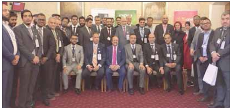
وفد غرفة مكة المكرمة مع أعضاء لجنة الحج والعمرة في البرلمان البريطاني