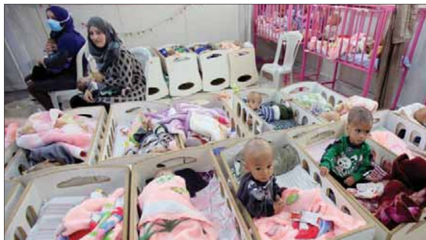
أطفال «داعش» المصابون بنقص التغذية في مستشفى الحسكة شمال شرق سوريا

ومدنيون محاصرون في الباغوز. وأصبح النازحون في الأسابيع القليلة الماضية عبئاً على نظام الرعاية الصحية في المناطق الخاضعة للإدارة الكردية في شرق سوريا.