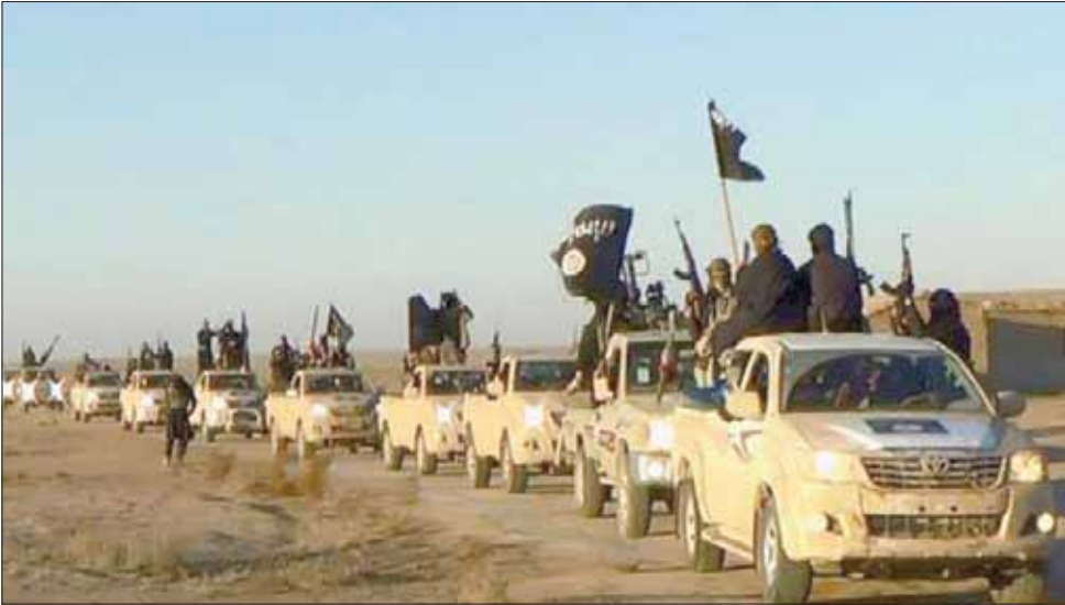
طابور سيارات «داعشية» في استعراض للقة على أطراف الرقة قبل اندحارهم من سوريا والعراق (أ.ب)

برسائله الإعلامية المتطرفة، وهنا يستدعي التطرق إلى مدى تأثير مثل هذه الإيديولوجية المتطرفة الدينية الإشارة إلى نظرية موجات الإرهاب الأربع في العصر الحديث