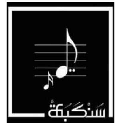
لندن، «الشرق الأوسط»

فيه الباحثون والمشترون لعقد الصفقات وإنما هو بالدرجة الأولى منبر لتبادل المعارف والعلوم الموسيقية حيث تقام العديد من الندوات والمحاضرات وورش العمل الموسيقية والثقافية وحلقات الحوار والنقاش وغيرها من الفعاليات الفنية في مختلف المجالات لصناعة الموسيقى.