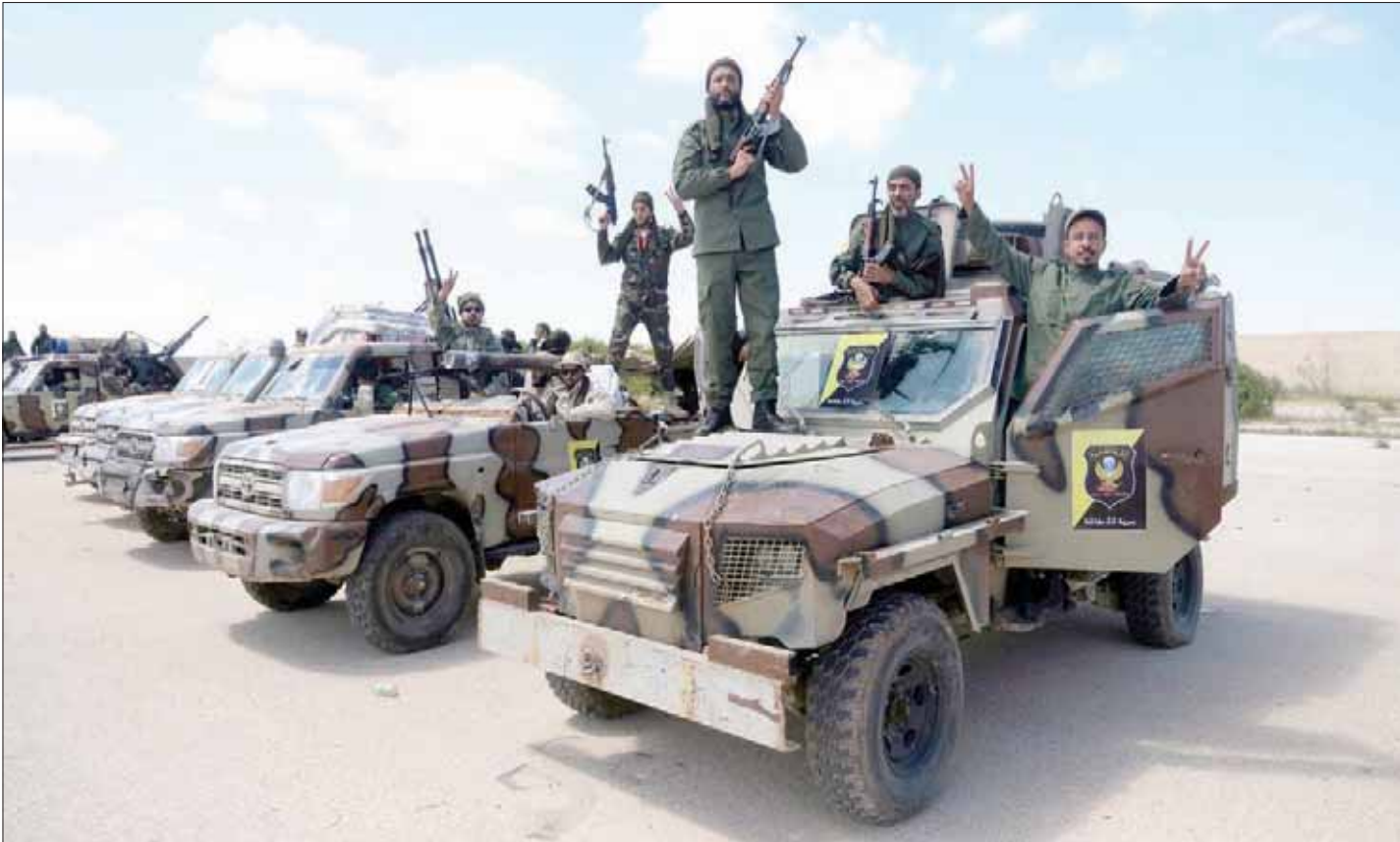
عناصر من الجيش الوطني الليبي تستعد للانطلاق في اتجاه طرابلس أمس

بكل مكوناته وإجهاض ثورة 17 فبراير (شباط)، داعياً من وصفهم بشرفاء ليبيا إلى الوقوف معه ضد حفتر.