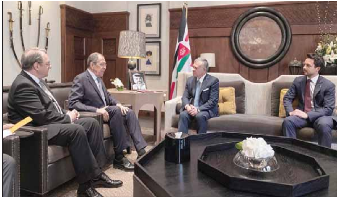
الملك عبد الله الثاني مستقبلاً وزير الخارجية الروسي سيرغي لافروف في العاصمة الأردنية أمس

الأميركية فيها. وتابع: «موقفنا واضح، الحل الوحيد للصراع الإسرائيلي الفلسطيني هو إنهاء الاحتلال وتلبية الحقوق المشروعة كاملة للشعب الفلسطيني الشقيق، وفق حل الدولتين وبما يضمن الحرية والديمقراطية للشعب الفلسطيني على ترابه الوطني وعاصمتها القدس الشرقية، هذا هو الموقف بغير ذلك سنغرق بالصراع بشكل أكبر». وعن القدس مرة أخرى، قال الصفاي: «كما قال جلاله الملك عبد الله، إن القدس خط أحمر للمملكة مستمرة في جهودها لتتصدى لأي خطوات أحادية تستهدف تغيير الهوية العربية الإسلامية والمسيحية للمقدسات فوق النقاش فيما يتعلق بالثوابت التي تحكم السياسة الأردنية»، وحول ما تم تداوله مؤخرًا في وسائل إعلام دولية تتعلق باعتراض أميركي جديد للسيادة الإسرائيلية على الضفة الغربية، قال الصفاي: «كلها مؤشرات خطيرة، نندد بمزيد من التصعيد، وأضاف: «سنعنا بعض التصريحات مؤخرًا من إسرائيل بأنه لن يكون هناك حل لمشكلة المستوطنين، ولن يكون هناك تنازل عن السيطرة الإسرائيلية على الضفة الغربية، وكل هذه مؤشرات خطيرة، تدفع باتجاه المزيد من التصعيد».