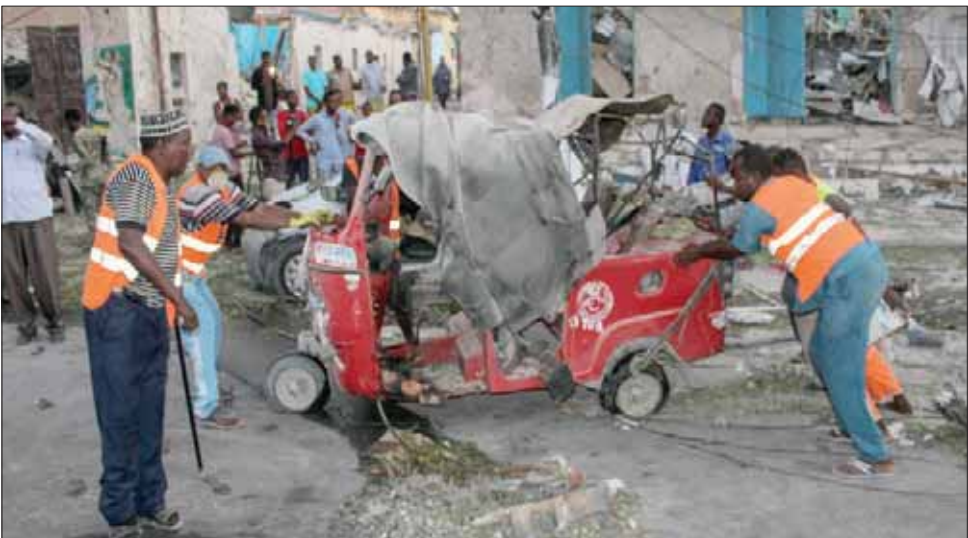
قتلى وخراب ودمار عقب تفجير سيارة مفخخة وسط العاصمة مقديشو في مارس الماضي

قيادي بارز في الحركة وهو يتجول في مقديشو، ويحضر نشاطاً لتوزيع الزكاة على السكان وسط المدينة، ما يؤكد تمتعها بحاضنة شعبية لم تنجح الحكومة في اختراقها.