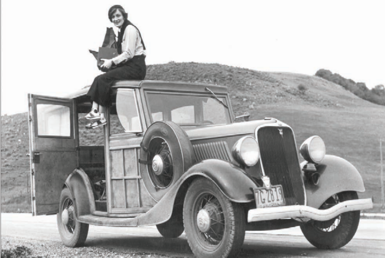
اشتهرت دوروثي لانغ في مجال التوثيق الفوتوغرافي... صورة أرشيغ في إحدى مهماتها عام 1936

هي خريجة جامعة هارفارد ولها نشاطات أكاديمية وثقافية وإعلامية وقانونية، وهي نموذج للمرأة العصرية في مجال الإعلام التي لم تتعرض للتحديات التي واجهت سابقيها، واستفادت من مناخ الحرية النسبية السائد حالياً من أجل تحقيق طموحاتها والوصول إلى أعلى المناصب القيادية في الإعلام الأميركي.