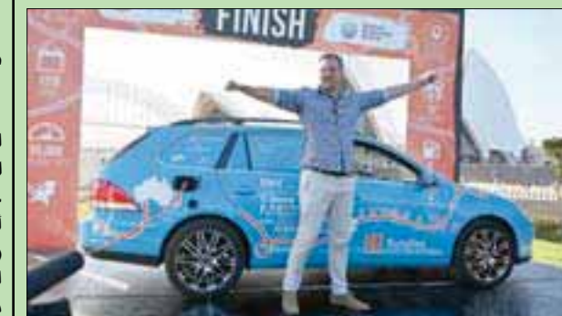
المغامر فيبي فوكر يحتفل في سيدني

واعتمدت الرحلة على مساندة غرباء من مختلف أنحاء العالم، قدموا الطعام والمأوى لفوكر، فضلاً عن الوسائل الأساسية لشحن سيارته على طول الطريق. وقال فوكر لمشجعيه كانوا في استقباله عندما وصل إلى خط النهاية: «ساعدني نحو 1800 شخص في رحلتي عبر أوروبا أطول رحلة مسجلة قطعها سيارة كهربائية على الإطلاق، وبدأت بهدف التوعية بمستقبل خالٍ من الكربون».