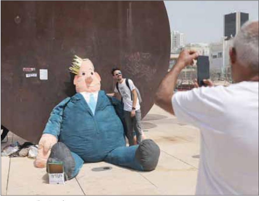
صور تذكارية مع دمية لنتنياهو صنعها طلاب إسرائيليون في تل أبيب

مواقع أخرى وزاد من عدد المستوطنين فيها. وبدل البؤرة الاستيطانية «عمونا» أقام مستوطنة «عميحاي». وبعد قرار المحكمة هدم 9 بيوت في مستوطنة «عوفرا»، جرى البدء ببناء 90 بيتا، وبعد هدم بيوت في البؤرة الاستيطانية «ناتيف هافوت» تحت المصادقة على بناء 350 بيتا في المستوطنات. «لقد هدمنا القليل وبنينا الكثير، والآن صادفنا على 18000 وحدة سكنية. لم يكن هناك بناء كهذا. وفي الولاية المقبلة، أعززم، بشكل تدريجي، فرض القانون الإسرائيلي على المستوطنات في يهوذا والسامرة». وأضاف أنه «انقذت أرض إسرائيل مقابل كل الضغوط، وأنا ابني (في المستوطنات) مثلما لم يتم البناء فيها أبدا، وساستمر في البناء واهتم بإنقاذ الاستيطان». وعندها انتقل نتنياهو إلى الحديث الصريح عن حملته لسحب أصوات اليمين بتخفيفهم من الأ بكلفة الرئيس الإسرائيلي، رؤوين رفلين، بتشكيل الحكومة المقبلة. «الناس لا يستوعبون أنه ستحدث مأساة هنا. صوت زائد أو ناقص لن يغير الوضع، لكن رفلين قال بصورة واضحة إنه إذا لم يوصه 61 عضو كنيست فإنه سيكلف الحزب الأكبر بتشكيل الحكومة. ليس لدينا 61 عضو كنيست لأن حزبا واحدا يقصد حزب «زيهوت» برئاسة موشيه فايلغين، لرفض الإعلان أنه سيوصي (بتكليف نتنياهو)، ووفقا لاستطلاعات فإن الحزب الأكبر هو ليبيد وغانتس الذي يتفوق علينا به مقاعد. وإذا لم نسد الفجوة فسوف يشكلون الحكومة»