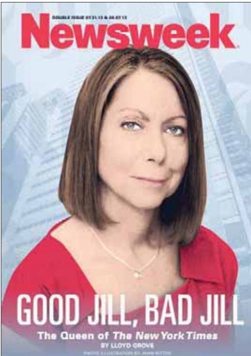
جيل أبرامسون أول سيدة تتسلم رئاسة تحرير «نيويورك تايمز» في تاريخ الصحيفة الممتد 160 عاماً على غلاف «نيوزويك»