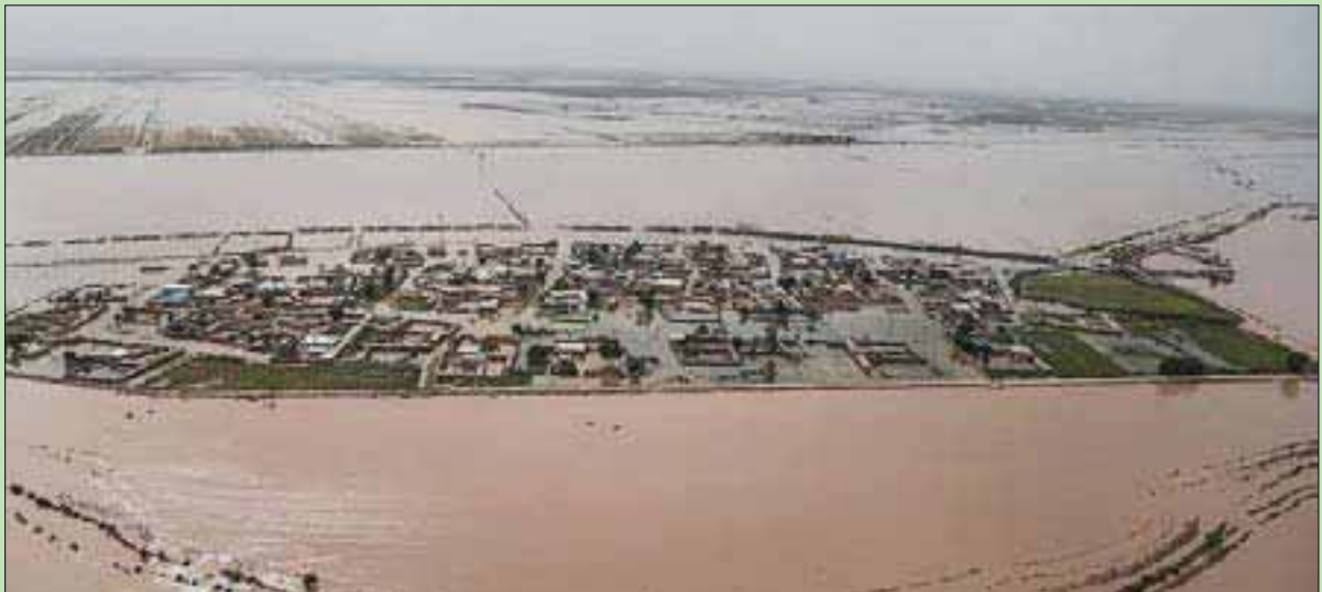
12 مدينة و180 قرية في جوار أنهار الكرخة وكارون محاصرة فيضانات شمال الأحواز (تسنيم)

غالبية ذخائر النفط الإيرانية على أراضيهم.