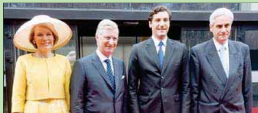
الأمير صاحب الخاتم جان كريستوف الثاني من اليمين

ذات لون أبيض شفاف، كانت من مجوهرات الإمبراطورة الفرنسية أوجيني، زوجة نابليون الثالث.