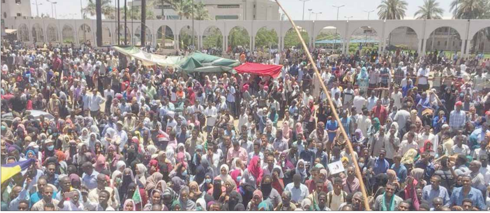
جانب من اعتصام المحتجين أمام مقر قيادة الجيش في الخرطوم أمس

وبالحشود البشرية، وتعطل عمل كثير من الدوائر الرسمية، فيما أعلنت مؤسسات خاصة يوم أمس عطلة. كما أغلق المحتجون شوارع الجامعة والجمهورية والبلدية، وهي أكبر شوارع الخرطوم عند تقاطعها مع شارع «قيادة الجيش»، ومنعوا مرور السيارات عدا تلك التي تحمل الأغذية والمياه والمؤن، بالإضافة إلى سيارات الجيش. أما وسط العاصمة فقد بدأ مشلولاً بالكامل، خصوصاً مناطق السوقين العربي والأفريقي اللتين تناقصت فيهما أعداد السيارات والمارة وتركزت الكفافة البشرية عند محطات المواصلات العامة، إلى الغرب والجنوب الغربي من مركزها، وختلت للقوات الأمنية التي نصبت مصابيد اعتقال للنشطاء في عدد من شوارعها. ورغم حرارة الخرطوم الغائظة، التي بلغت أمس وأول من أمس، 42 درجة مئوية، فإن المعتصمين وصلوا الاعتصام والاحتجاج دون كلل، بيد أن نشطاء و«تجمع المهنيين» دعوا المواطنين لتوفير «الخيام» والمظلات للمحتجين.