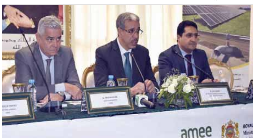
عزيز الرباح وزير الطاقة والمعادن المغربي يتوسط محمد غزالي وكيل وزارة الطاقة والمعادن وسعيد ملين مدير الوكالة المغربية للتجارة في مجال الطاقة

وأوضح الرباح أن الحكومة تواصل إصلاح الإطار القانوني للقطاع، مشيراً إلى أن قانوناً جديداً يناقش في البرلمان سيسمح للأسر بالاستثمار في منظومات للطاقة الشمسية لتلبية حاجياتها الذاتية وبيع الفائض عبر ضخمه في الشبكة الكهربائية الوطنية. كما أشار الرباح إلى إعداد قانون جديد يضع اشتراطات على الشركات التي تقدم خدمات الطاقة، من حيث الموارد البشرية ومهندسين وتقنيين وكفاءات، وجودة الإدارة والمنتجات، إضافة إلى قانون ينظم فتح محطات التزويد بالوقود وشرط استيراد المحروقات والمنتجات النفطية. وقال: «القاعدة التي نعتمدها تتلخص في تحرير السوق وإفساح المجال أمام المنافسة مع تشديد المراقبة».