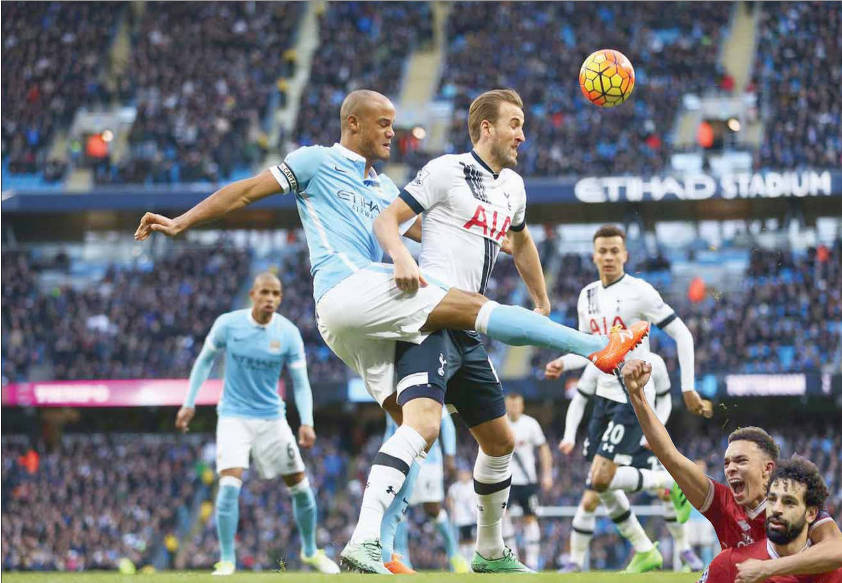
كين وكومباني نجما توتنهام ومانشستر سيتي ينقلان صراعهما المحلي إلى دوري الأبطال

ويمكن القول بأن أحد أبرز الجوانب المتعلقة بمواجهة الأندية الإنجليزية لبعضها البعض في دوري أبطال أوروبا يتمثل في أنها قد تساهم في خلق عداء جديد بين الجماهير الإنجليزية، على الرغم من أن العلاقات بين مشجعي مانشستر سيتي وتوتنهام هوسبر توترت كثيراً، وتتمنى أن تظل كذلك. وفي النهاية، فإن عشاق الساحرة المستديرة حول العالم يتطلعون لقاء مانشستر سيتي وتوتنهام هوسبر لأنه يجمع أفضل فريقين في إنجلترا من الناحية الهجومية، ومن المؤكد أنه سيكون لقاء ممتعاً للغاية.