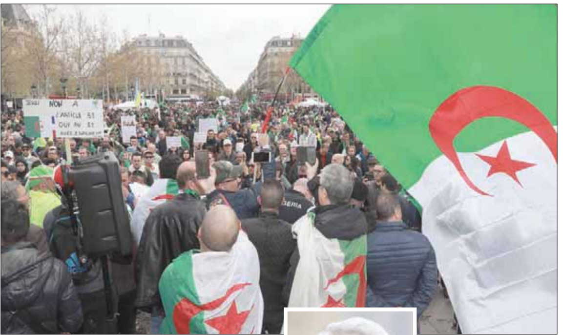
مظاهرون جزائريون في باريس أمس يطالبون بإدخال إصلاحات جذرية على النظام في بلادهم

بدأ البرلمان الجزائري، أمس (الأحد)، سلسلة خطوط انعقد جلسة، غداً (الثلاثاء)، لانتخاب رئيس مؤقت للبلاد، خلفاً لعبد العزيز بوتفليقة الذي تخلى عقب أسابيع من الاحتجاجات العاشدة.