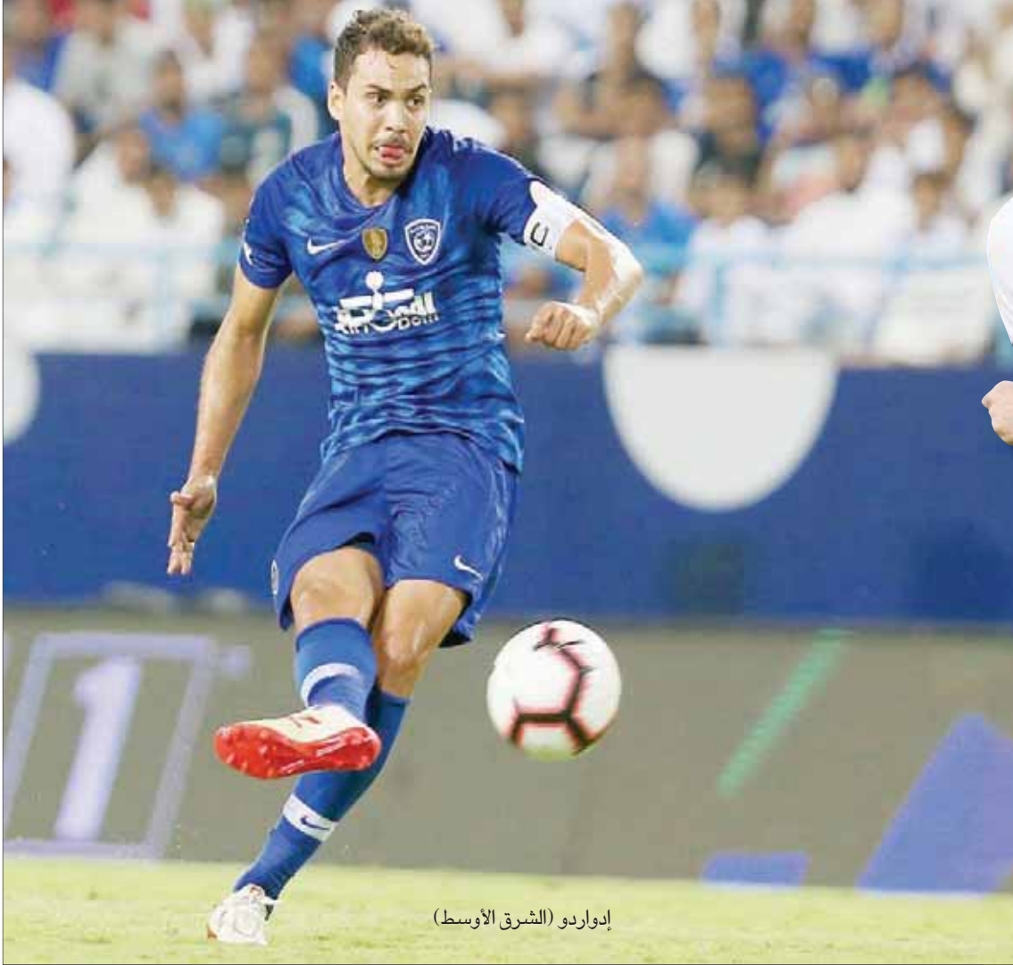
إدواردو (الشرق الأوسط)

وعلى الجانب الآخر، لا يمتلك أصحاب الأرض سوى نقطة واحدة، بعد التعادل مع الجولة الإماراتية بهدف مثلث في الجولة الماضية، وكان الفريق الإيراني قد خسر المباراة الافتتاحية (3 / 0) من الدحيل القطري. ويدرك الألماني وينفريد شايفر قوة الضيوف الضاربة في الخطوط الأمامية، ولن يجازف بمجازاتهم، وسيغلق جميع المنافذ الخلفية، والاعتكاف على الجانب الآخر، لا يمتلك أصحاب الأرض سوى نقطة واحدة، بعد التعادل مع الجولة الإماراتية بهدف مثلث في الجولة الماضية، وكان الفريق الإيراني قد خسر المباراة الافتتاحية (3 / 0) من الدحيل القطري. ويدرك الألماني وينفريد شايفر قوة الضيوف الضاربة في الخطوط الأمامية، ولن يجازف بمجازاتهم، وسيغلق جميع المنافذ الخلفية، والاعتكاف على الجانب الآخر، لا يمتلك