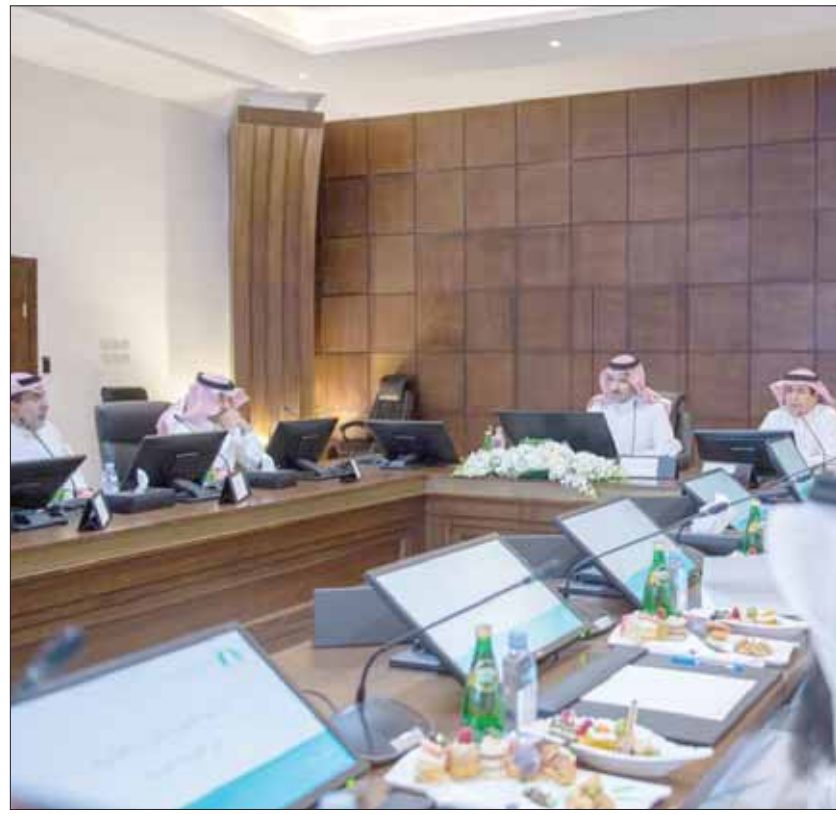
المدينة المنورة، «الشرق الأوسط»

عقد الأمير فيصل بن سلمان بن عبد العزيز أمير منطقة المدينة المنورة أمس اجتماعاً مع سليمان الحمدان وزير الخدمة المدنية والوفد المرافق له بحضور عدد من مسؤولي إمارة المنطقة الجديدة لللائحة التنفيذية الجديدة للموارد البشرية. وأوضح الأمير فيصل بن سلمان أن الاجتماع يأتي ضمن التواصل المباشر بين القطاعات الحكومية، منوهاً بأهمية مثل هذه الاجتماعات في تذييل الصعوبات وتوضيح الأهداف والمهام المشتركة بين الجهات، معرباً عن شكره لوزير الخدمة المدنية والوفد المرافق له على ما قدموه من شرح مفصل عن اللائحة الجديدة للموارد البشرية، وما احتوته من محفزات تهتم بالارتقاء في الأداء، من خلال تحقيق نظام حديث يتصف بالمرونة والشمولية.