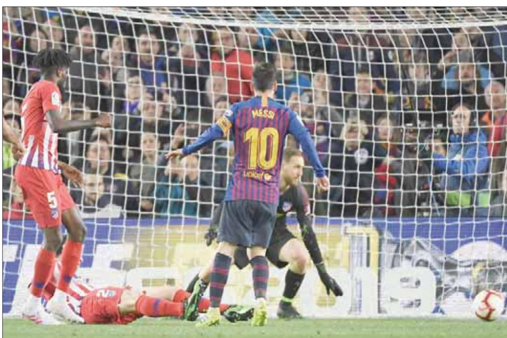
ميسي (رقم 10) يسجل ثاني أهداف برشلونة في مرمى أتلتيكو