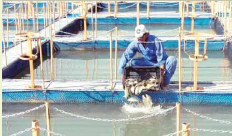
إحدى مزارع بركة غليون

على حيازة زريعة الأسماك، ونقص في إمدادات المياه، بما يؤدي إلى زيادة تركيز المادة العضوية وزيادة الأمونيا عن النسب المسموح بها.