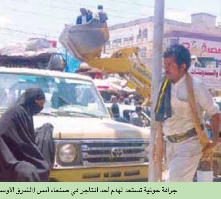
جرافة حوثية تستعد لهدم أحد المتاجر في صنعاء أمس (الشرق الأوسط)

عدن، علي ربيع صنعاء، «الشرق الأوسط» شنت ميليشيات الحوثي حملة مكثفة لملاحقة الباعة المتجولين وأصحاب المتاجر الصغيرة في العاصمة صنعاء، أمس. وأفادت مصادر محلية بأن عناصر من الحوثيين أقبلوا على متن عربات مسلحة، برفقة جرافة وشاحنات نقل، واعتدوا على مالكي البسطات وباعة متجولين وخطفوا أعداداً منهم، ودمروا محال بالجرافة على امتداد سوق السنيحة وشارعي 20 وهائل في العاصمة. وتابعت المصادر لـ«الشرق الأوسط»، أن متاجر «دمرتها جرافات الحوثيين فوق رؤوس أصحابها، في حين أغلقت أبواب البعض الآخر نتيجة