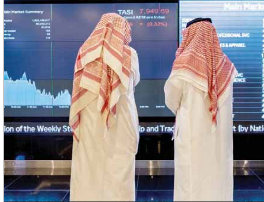
متعاملان يتابعان حركة الأسهم السعودية في مركز تداول في الرياض (غيتي)

للمؤتمر هذا العام لانطلاقه بالغة الأهمية، إذ يتعدى بعد مرور 11 شهراً من إطلاق «برنامج تطوير القطاع المالي»، أحد البرامج التنفيذية لـ «رؤية المملكة 2030»، الذي يهدف إلى تطوير قطاع مالي متنوع وفعال لدعم تنمية الاقتصاد الوطني، وتحفيز الادخار والتمويل والاستثمار، من خلال تعزيز مكانة مؤسسات القطاع المالي، والسوق المالية بصفتها سوقاً مالية متقدمة، وتعزيز وتمكين التخطيط المالي لدى مختلف شرائح المجتمع.