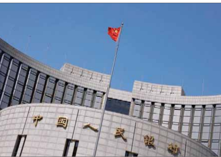
البنك المركزي الصيني

التجارية لا يستهان بها لا تزال في حاجة إلى الإنجاز. وانخفضت قيمة احتياطات الذهب الصينية في مارس إلى مؤشر 79,525 مليار دولار مقابل 79,498 مليار دولار في نهاية فبراير (شباط). واستشعر المستثمرون الدوليون خلال العام الماضي بالقلق بشأن مخاطر هروب رؤوس الأموال من الصين مع تباطؤ الاقتصاد، ودار جدل عن مدى ستمسح بكين بضعف العملة، ولكن مؤخرًا انتقل الجدل إلى السؤال عن أي مدى ستقبل السلطات الصينية بضعف قيمة الدولار، مع دفع التدفقات الداخلة لسوق المال الصيني العملة الوطنية لارتفاع. وارتفعت الأسهم الصينية بأكثر من 20 في المائة هذا العام مع