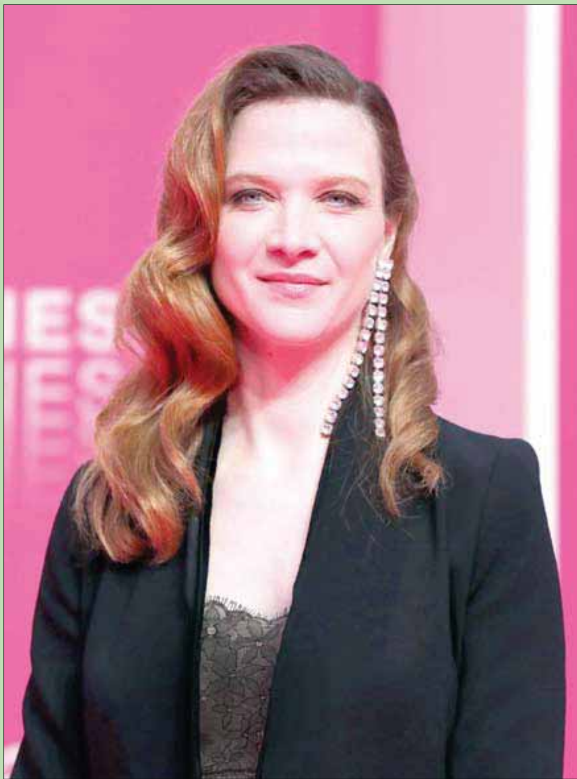
المثلة الفرنسية أوديلي فيليمين لدى حضورها افتتاح مهرجان كان السينمائي لعام 2019 أمس

الذي ساهم في خراب ليبيا واليمن وسوريا - لا نقول بتحمل وحده المسؤولية، لكنه مساهم رئيس - هو الدور الإخواني والإيراني والتركي، وكل هؤلاء، في مكان ما، إما رضعوا من المال القطري أو تغطوا بعباءة الإعلام القطري، المباشر وغير المباشر، تلك هي الحقيقة.