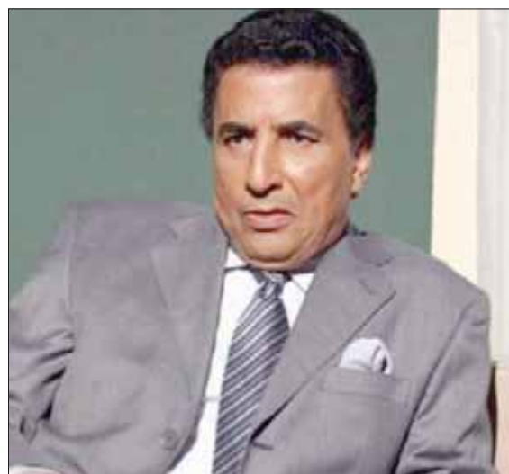
الراحل إسماعيل محمود