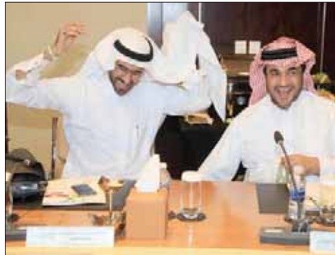
رئيس الشباب وممثل النادي الأهلي