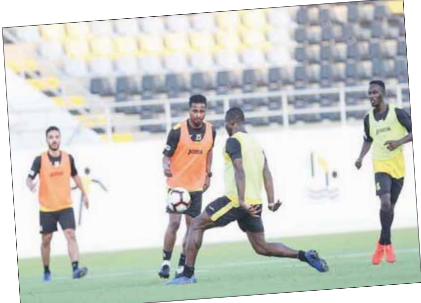
من تدريبات الاتحاد الأخيرة (الشرق الأوسط)

إلى ذلك، أشارت مصادر مطلعة لـ«الشرق الأوسط» إلى توجه اتحادي لرصد مكافأة خاصة للاعبين في حال تحقيقهم الفوز على الفريق الأوزبكي في إطار مساعيهم لتحفيز ودعمهم لمواصلة نغمة الانتصارات.