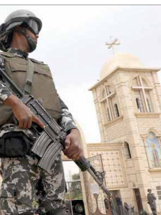
جندي مصري من القوات الخاصة يحرس مدخل الكاتدرائية القبطية في سواج أمس

متأثراً بإصابته، وأضاف «انتقلت القيادات الأمنية لمحل الحادث لتمشيط المنطقة وضبط الجناة». بدوره، أمر النائب العام المصري، المستشار نبيل أحمد صادق، بانتقال فريق من أعضاء نيابة أمن الدولة العليا ونيابة شرق القاهرة الكلية إلى مكان الحادث للوقوف على ملابساته واتخاذ ما يلزم من إجراءات التحقيق. وقالت مصادر أمنية إن «الأجهزة بدأت بفحص كاميرات المراقبة الموجودة في المنطقة لكشف عموض الحالة بدائرة القسم، توقفت سيارة سوداء اللون تحمل لوحات معدنية بيضاء اللون مدونة بخط اليد بشوارع طه حسين، يستقلها 4 أشخاص مجهولون، وحال توجيههم لاستبيان الأمر وفحصهم، حيث قتل المئات من رجال الشرطة وكذا الجيش في اعتداءات إرهابية. ومنذ عزل الرئيس «الإخواني» الأسبق محمد مرسي، في يوليو (تموز) عام 2013، تستهدف مجموعات متطرفة قوات الأمن، خاصة في شمال شبه جزيرة سيناء، حيث قتل المئات من رجال الشرطة وكذا الجيش في اعتداءات إرهابية. ومن جهة أخرى، خففت محكمة النقض، أعلى جهة قضائية في مصر، عقوبة الإعدام بحق 5 متهمين في القضية المعروفة إعلامياً بـ «خلية دمياط الإرهابية»، إلى أحكام بالسجن المؤبد والمشدد 15 عاماً، كما برأت 3 آخرين.