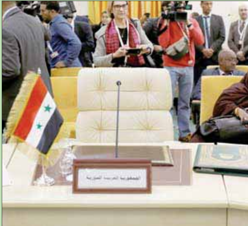
مقعد سوريا يبدو فارغاً في جلسة وزراء الخارجية العرب أمس تحضيراً لقمة تونس