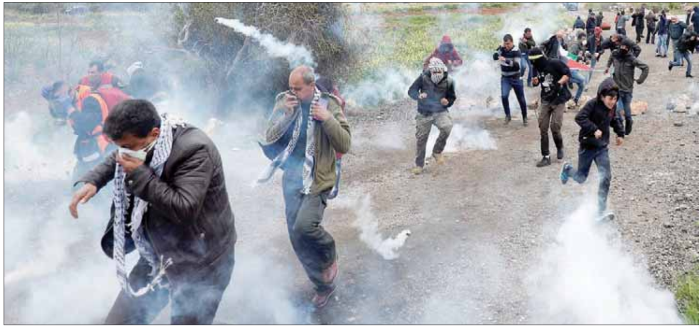
متظاهرون فلسطينيون يواجهون قنابل الغاز الاسرائيلية في الخليل