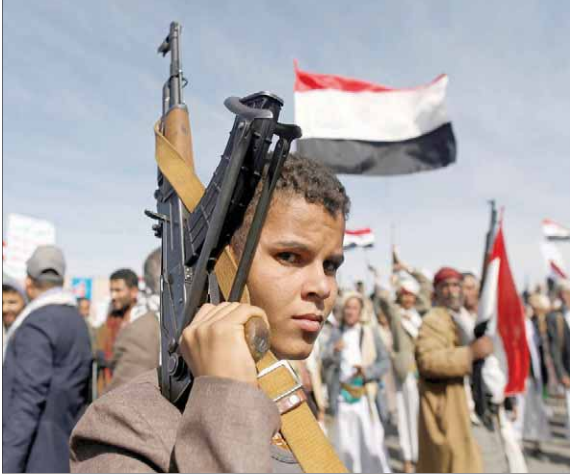
طفل يحمل سلاحا في تجمع حوثي بصنعاء

كشف مسؤول يمني رفيع، عن أن 30 من رجال الأعمال البارزين، الذين يقعون الآن تحت الإقامة الجبرية في العاصمة صنعاء، طلبوا من الحكومة اليمنية إيجاد طريقة لإخراجهم بشكل عاجل من المدينة بعد أن تلقوا تهديداً مباشراً بالقتل إن أوقفوا عملية تدفق المبالغ المالية إلى خزائن قيادات رئيسية في الميليشيات تحت ما تدعيه بـ«المجهود الحربي». ويعت رجال الأعمال، الذين تتحفظ الحكومة الشرعية على أسمائهم لدواع أمنية، برسائل عبر وسيطاء إلى الحكومة الشرعية، يطالبونها بإخراجهم بأي شكل، وبخاصة أن الكثير منهم بدأ يفقد التحكم والسيطرة في التعامل مع حساباته المالية وممتلكاته الثابتة والمنقولة، موضحين أنهم يعولون على هذا التحرك في وقف نزيفهم المالي الذي تعبت به الميليشيات. وبحسب المعلومات التي حصلت عليها «الشرق الأوسط»، فإن الميليشيات قامت برصد كافة الأصول والممتلكات المالية لرجال الأعمال المتواجدين في صنعاء، وجميع العمليات المالية التي نفذت منذ مطلع العام الحالي تهديداً للاستيلاء عليها في حال رفضوا تنفيذ الأوامر في تقديم الأموال، في حين ألزمت الميليشيات وتحت تهديد السلاح من مديري البنوك والمؤسسات المصرفية التي ما زالت تعمل في صنعاء، بتقديم كشوف يومية عن العمليات المالية التي تجري في كل يوم، وتفسير التقارير الواردة من صنعاء، إلى أن الوضع الاقتصادي في المدينة مندوهر جداً، وبخاصة بعدما تضيت الكثير من المصارف المالية التي كانت الميليشيات الانقلابية تعتمد عليها، ومنها البنك المركزي، الذي فطنت الحكومة التي أقرت تحويل مقره إلى