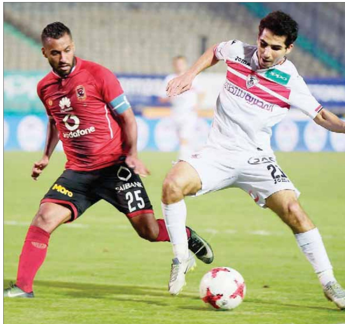
عشاق الدوري المصري على موعد مع قمة كروية اليوم بين الزمالك والأهلي (أغب)