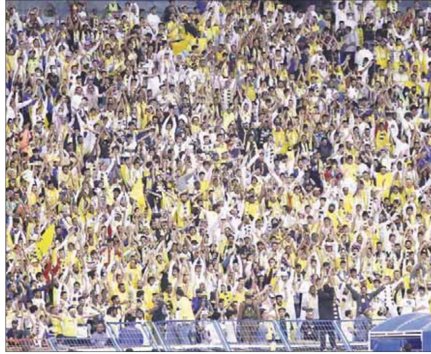
جمامير النصر قادت فريقها للفوز الكبير

وتلقى سلطان الغنام بطاقة صفراء بعد تدخله على إدواردو وحرمانه الهلال من هجمة مرتدة وأعدة، وغابت الجميل الفنية الهلالية والنصرراوية في الدقائق الخمس الأخيرة من هذا الشوط بسبب كثرة الكرات الخاطئة في التمير والتحفظ الدفاعي الذي اعتمد عليه مدربا الفريقين، واستغل جوفينكو لاعب الهلال هفوة دفاعية نصرراوية وخطف الكرة من عبد الرحمن العبيد ومررها للفرنسي غوميز الغائب تماماً عن أجواء اللقاء، إلا أن البرازيلي مايجون مدافع النصر