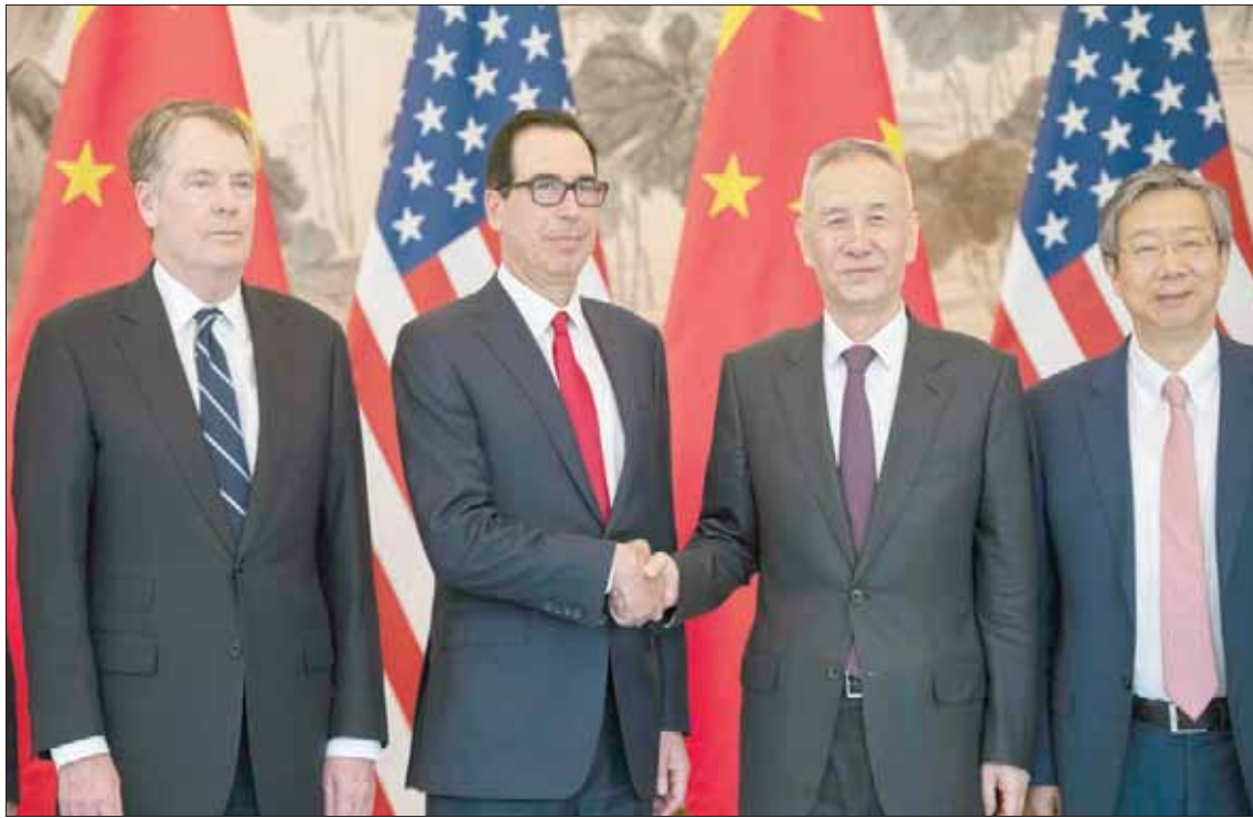
نائب رئيس الوزراء الصيني ليو هي مصافحاً وزير الخزانة الأمريكي ستيفن منوتشين بينما يبدو بجوارهما كل من الممثل التجاري الأمريكي روبرت لايتهاييزر ومحافظ البنك المركزي الصيني يي غانغ في ختام المباحثات التجارية في بكين أمس

الرسوم الجمركية، كما قال خبير الاقتصاد كوي فان من الجامعة الدولية للأعمال والاقتصاد في بكين لووكالة الصحافة الفرنسية. وقال كوي: إن الهدنة المتفق عليها بين ترمب وشي تنص على «التوصل إلى اتفاق بأسرع وقت ممكن، باتجاه الإلغاء المتبادل للرسوم العقابية التي فرضها الطرفان». واتخذت بكين إجراءات للاستجابة لبعض الشكاوى الأمريكية، مع إقرارها لإقرار قانون هذا الشهر يهدف إلى ضمان حماية الشركات الأجنبية من النقل القسري للتكنولوجيا. ويتضمن أيضاً مواد لحماية الأسرار التجارية للشركات الأجنبية، ويفرض عقوبات على المسؤولين الذين يقومون بتسريب معلومات يحصلون عليها من شركات خارجية. وكثفت الشركات الحكومية الصينية أيضاً شراءها المواد الزراعية الأمريكية، مثل حبوب الصويا. ويتوقع أن يخلص أي اتفاق بين الطرفين على شراء الصين بشكل كحذف بضائع أمريكية بهدف خفض العجز التجاري بين الولايات المتحدة والصين، الذي يتغير حساسية سياسية، وبلغ رقماً قياسياً العام الماضي عند مستوى 419,2 مليار دولار.