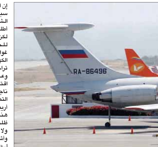
طائرة روسية في مطار كاراكاس الدولي

وذكر آخر تقرير للمنظمة الدولية حول الوضع الإنساني في فنزويلا، بأن هناك زهاء خمسة آلاف شخص يُغادرون البلاد يومياً، مشيراً إلى أن أكثر من 3,4 ملايين شخص يعيشون لاجئين أو مهاجرين في دول مجاورة. ويحتاج 24 في المائة من سكان فنزويلا، أي 7 ملايين شخص، إلى مساعدة إنسانية، حسب التقرير، الذي سلّم إلى الرئيس نيكولاس مادورو، الذي حثل المعارض خوان غوايدو والعقوبات الاقتصادية الأميركية ومسؤولية الوضع في البلاد. واستناداً إلى التقرير الواقع في 45 صفحة، والمتضمن أرقاماً قدمتها جامعات فنزويلية، فإن أكثر من 94 في المائة من السكان كانوا يعيشون في الفقر عام 2018، بينهم 60 في المائة يعيشون في فقر مدقع. وانخفض استهلاك اللحوم والخضراوات بين عامي 2014 و2017، كما انخفض استهلاك الحليب بنسبة 77 في المائة.