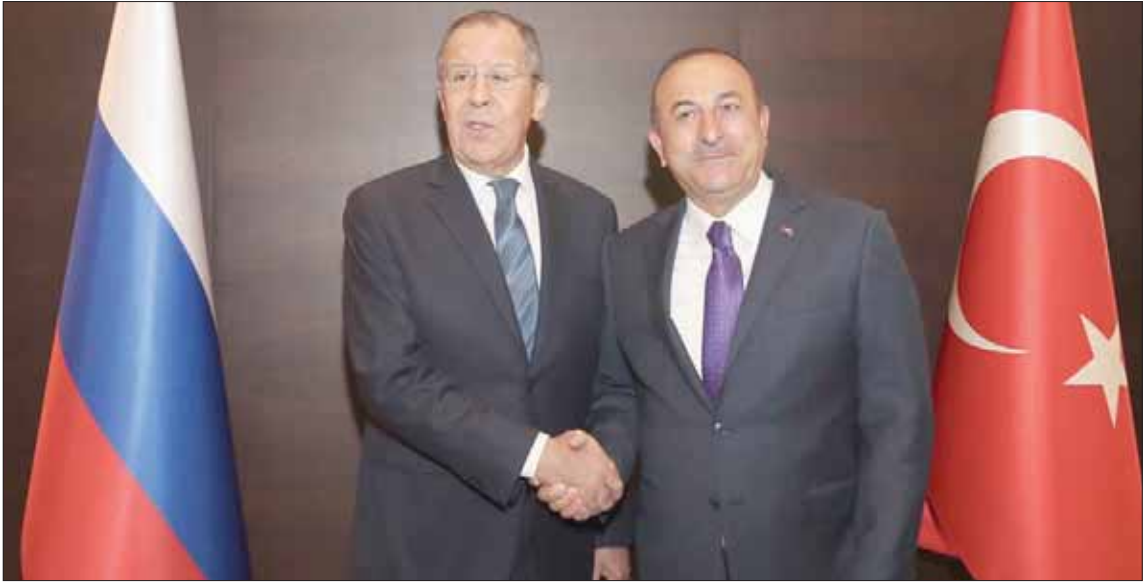
جاويش أوغلو مع نظيره الروسي سيرغي لافروف عقب الاجتماع السابع لمجموعة التخطيط الاستراتيجي المشتركة التابعة لمجلس التعاون التركي الروسي الذي عقد في مدينة أنطاليا

وكان 4 أعضاء في مجلس الشيوخ الأميركي قدموا، أول مشروع قانون يدعمه الجمهوريون والديمقراطيون لمنع تسليم مقاتلات «إف - 35» لتركيا إلى أن تؤكد الحكومة الأميركية أن أنقرة لن تتسلم نظام الدفاع الجوي الروسي (إس