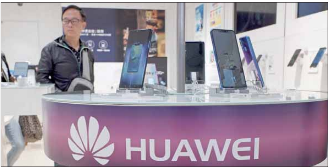
كانت أسرع مناطق النمو للشركة هي أوروبا والشرق الأوسط وأفريقيا

كانت عادة ماكثر من 20 في المائة في السنوات الماضية. وأفادت الشركة أن صافي أرباحها زاد بنسبة 25 في المائة ليصل إلى 8,8 مليار دولار العام الماضي. ومثلت الأسواق الخارجية 48,4 في المائة من نشاط هاواي في 2018، مقابل 49,5 في المائة في السنة السابقة. وكانت أسرع مناطق النمو للشركة هي أوروبا والشرق الأوسط وأفريقيا بنمو نسبته 24,3 في المائة، لتأتي بعدهم أميركا الشمالية وأميركا الجنوبية بنمو بنسبة 21,3 في المائة.