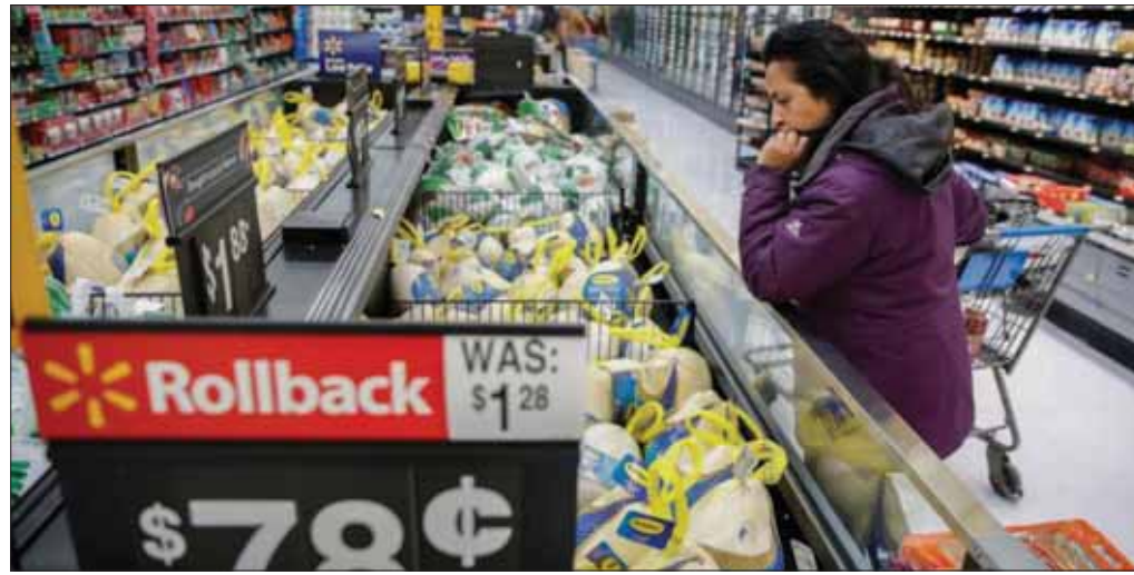
أظهرت البيانات الأمريكية نمواً أقل من المتوقع خلال الربع الأخير من العام الماضي

الأميركي فقد بعض قوته في الفترة الأخيرة، وذلك مع تزايد المخاوف بشأن الاقتصاد. وأضاف رئيس «بيركشاير هانواي» في تصريحات لـ«سي إن بي سي»، أول من أمس (الخميس): «يبدو أن وتيرة النمو الاقتصادي تباطأت، إنه مثل الأشياء التي تتباطأ». وتابع: «هذا التباطؤ لا يغير أي شيء نقوم به، فسوف نستمر في الاستثمار بالطريقة التي نقوم بها». وأكد بافيت على موقفه بأن الولايات المتحدة أفضل مكان للاستثمار.