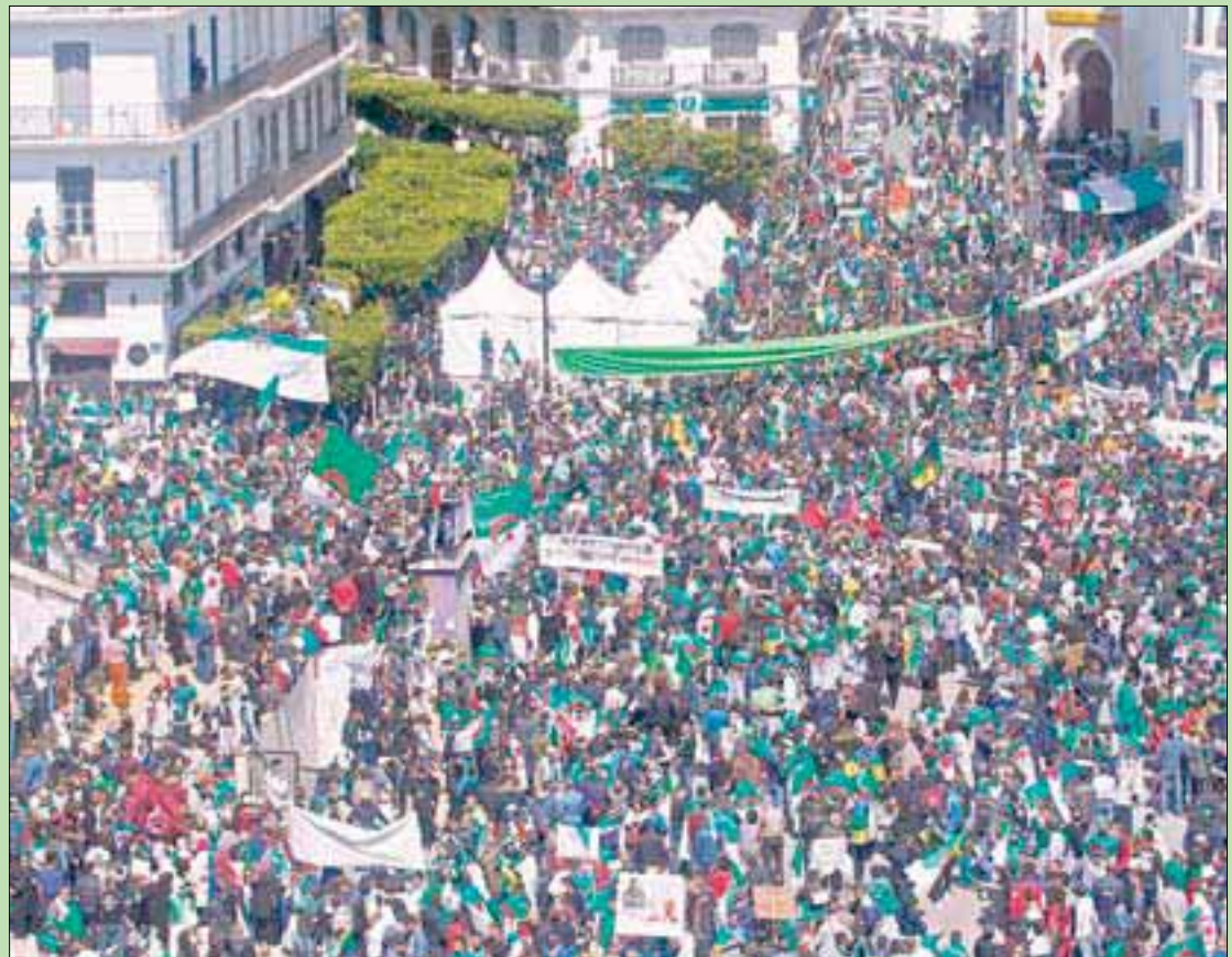
جانب من المظاهرة الحاشدة التي شهدتها العاصمة الجزائرية أمس للمطالبة بتنحي الرئيس عبد العزيز بوتفليقة

الجزائر، بوعلام غمراسة لندن، «التشرق الأوسط»