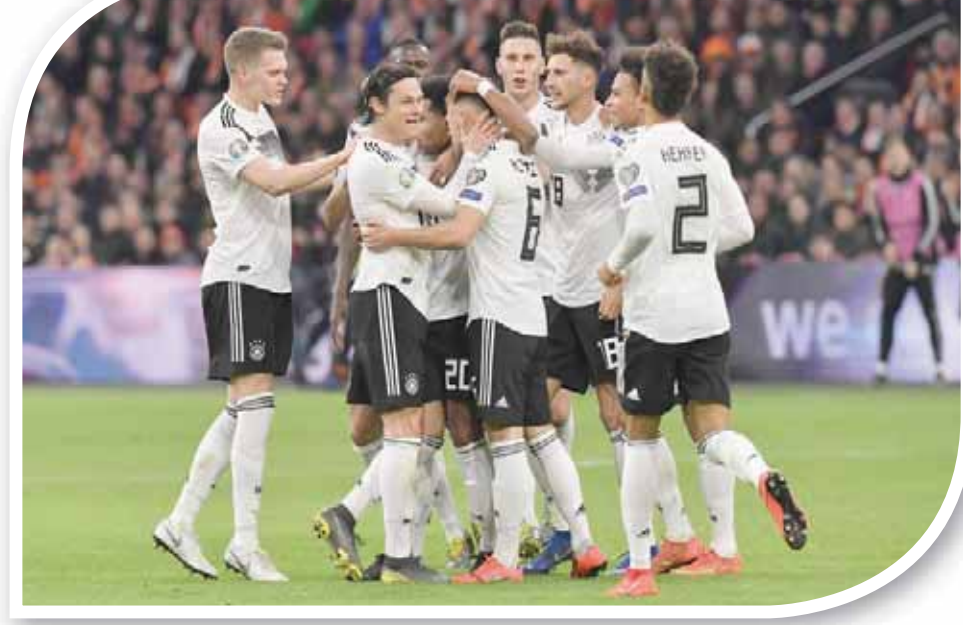
ألمانيا... أخيراً في المسار الصحيح

يلعب بكل ثقة وثبات داخل المستطيل الأخضر، وما زلنا نتذكر جميعاً ما فعله في ريال مدريد وتلاعبه بداني كارفاخال على ملعب «سانتياغو بيرنابيو» في المباراة التي سحق فيها النادي الهولندي النادي الملكي بأربعة أهداف مقابل هدف وحيد.