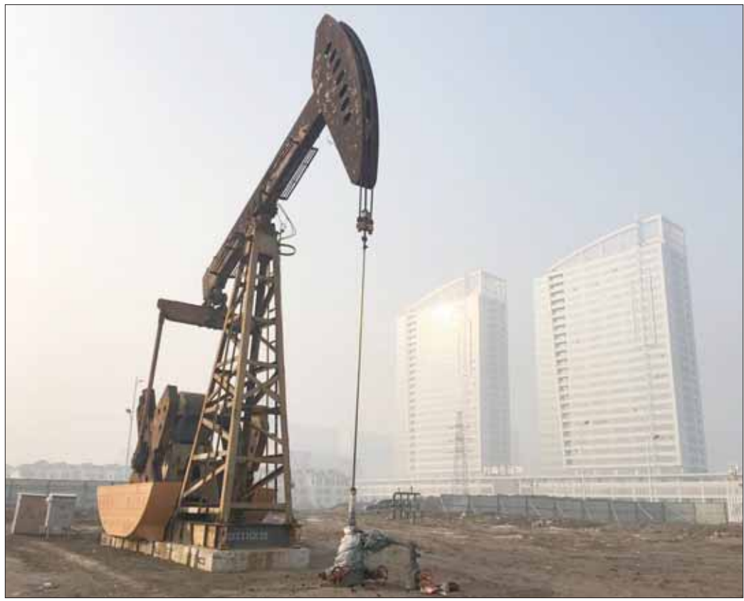
تتجه أسعار النفط لتسجيل أقوى أداء فصلي منذ عام 2009

ومن المتوقع أن يبلغ الفارق بين برنت وخام غرب تكساس الوسيط الأميركي 8,65 دولار في الربع الثاني من 2019، لينكمش إلى 8,04 دولار و6,85 دولار على مدى الفصلين القادمين على الترتيب. وقال تشيلينغوريان: «بحلول نهاية 2019 نتوقع أن يتكهن فارق السعر بين خام غرب تكساس الوسيط وبرنت كثيراً في الوقت الذي تدخل فيه صادرات الولايات المتحدة من الخام الخفيف المنافسة في حوض الأطلسي والأسواق الآسيوية».