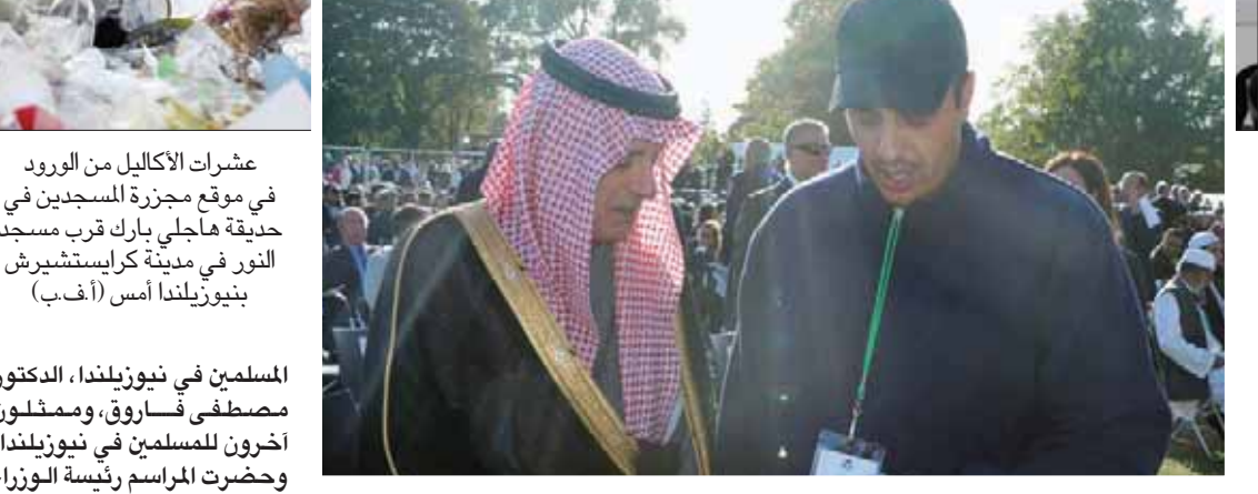
عادل الجبير عضو مجلس الوزراء السعودي وزير الدولة للشؤون الخارجية يتحدث إلى أحد المصابين في نيوزيلندا أمس

شاركت حشود شعبية كبيرة وفود رسمية من 59 دولة وممثلون من المنظمات الإسلامية والدولية بحضور رئيسة الوزراء النيوزيلندية جاسيندا آردين في المراسم الوطنية التي أقيمتها حكومة نيوزيلندا يوم أمس لتأبين الضحايا 50 من المسلمين الأبرياء الذين قُضوا أثناء تاديتهم صلاة الجمعة في 15 مارس (آذار) في مسجدي النور ولينوود في مدينة كرايستشيرش. وشاركت الدبلوماسية السعودية في مراسم العزاء، حيث وجد في مراسم التأبين عادل الجبير عضو مجلس الوزراء السعودي وزير الدولة للشؤون الخارجية، والذي جدد التأكيد على وقف بلاده بقيادة خادم الحرمين الشريفين الملك سلمان بن عبد العزيز ولي عهده الأمير محمد بن سلمان مع ذوي ضحايا الحادث الإرهابي، مؤكداً في ذات السياق رفض الرياض لكافة أشكال التطرف والإرهاب مقدماً التعازي لنيوزيلندا حكومة وشعباً. وثمن الوزير الجبير موقف رئيسة الوزراء والشعب النيوزيلندي وتعاملهم مع الحادث الأليم، مشيراً إلى أنهم أتبعوا للعالم أن نيوزيلندا بلد منفتح للعالم وتسويرو فيه المحبة والإنسانية، حيث قال عبر حسابه بموقع التواصل الاجتماعي «تويتر» «شاركت في مراسم تأبين ضحايا الهجوم الإرهابي في نيوزيلندا وشهدت على حرص الحكومة النيوزيلندية على وحدة المجتمع النيوزيلندي بكافة أطبائه... التعاطف كل النيوزيلنديين من كل الأديان حول المسلمين في بلادهم يؤكد أن نيوزيلندا مثال للتعاطف والتسامح والإنسانية». وقدم الوزير السعودي تعازي حكومة بلاده لذوي الضحايا وأمنيات الشفاء للمصابين خلال