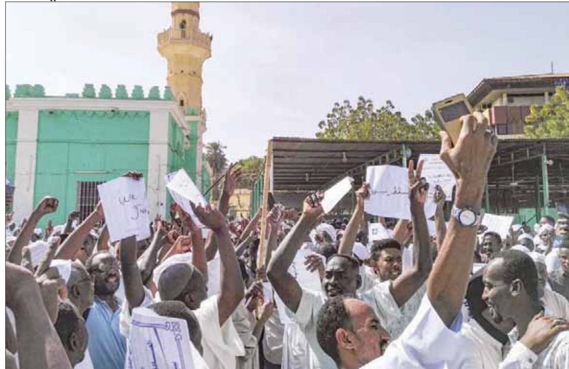
جانب من مظاهرة هتفت ضد البشير في الخرطوم