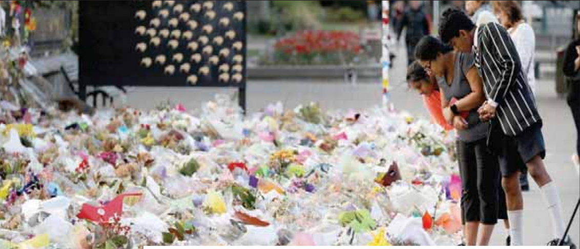
كرايستشيرش (نيوزيلندا)، الشرق الأوسط

شاركت حشود شعبية كبيرة وفود رسمية من 59 دولة وممثلون من المنظمات الإسلامية والدولية بحضور رئيسة الوزراء النيوزيلندية جاسيندا آردين في المراسم الوطنية التي أقيمتها حكومة نيوزيلندا يوم أمس لتأبين الضحايا 50 من المسلمين الأبرياء الذين قُضوا أثناء تاديتهم صلاة الجمعة في 15 مارس (آذار) في مسجدي النور ولينوود في مدينة كرايستشيرش. وشاركت الدبلوماسية السعودية في مراسم العزاء، حيث وجد في مراسم التأبين عادل الجبير عضو مجلس الوزراء السعودي وزير الدولة للشؤون الخارجية، والذي جدد التأكيد على وقف بلاده بقيادة خادم الحرمين الشريفين الملك سلمان بن عبد العزيز ولي عهده الأمير محمد بن سلمان مع ذوي ضحايا الحادث الإرهابي، مؤكداً في ذات السياق رفض الرياض لكافة أشكال التطرف والإرهاب مقدماً التعازي لنيوزيلندا حكومة وشعباً. وثمن الوزير الجبير موقف رئيسة الوزراء والشعب النيوزيلندي وتعاملهم مع الحادث الأليم، مشيراً إلى أنهم أتبعوا للعالم أن نيوزيلندا بلد منفتح للعالم وتسويرو فيه المحبة والإنسانية، حيث قال عبر حسابه بموقع التواصل الاجتماعي «تويتر» «شاركت في مراسم تأبين ضحايا الهجوم الإرهابي في نيوزيلندا وشهدت على حرص الحكومة النيوزيلندية على وحدة المجتمع النيوزيلندي بكافة أطبائه... التعاطف كل النيوزيلنديين من كل الأديان حول المسلمين في بلادهم يؤكد أن نيوزيلندا مثال للتعاطف والتسامح والإنسانية». وقدم الوزير السعودي تعازي حكومة بلاده لذوي الضحايا وأمنيات الشفاء للمصابين خلال