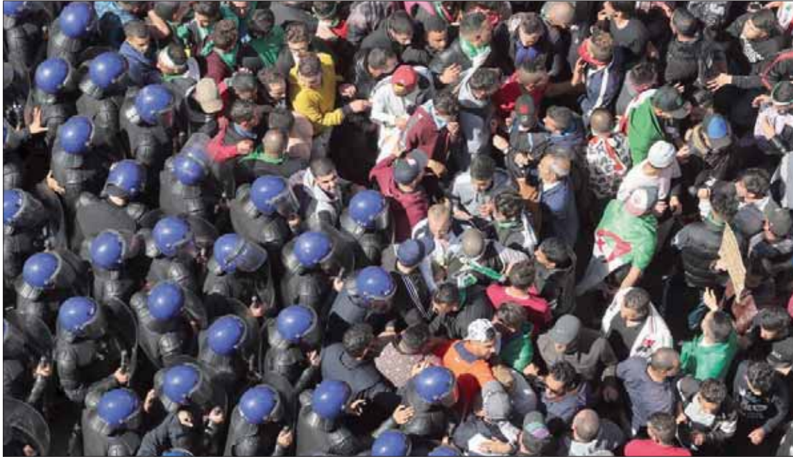
جانب من المواجهات التي شهدتها شوارع العاصمة الجزائرية أمس بين المحتجين وقوات الأمن

الاركان يمر حتماً على هيئتين: قريبة من الحكومة قالت إن بلعين، المعروف بولائه الشديد لبوتفليقة، رفض التجاوب مع طلب صالح، واشترط أن تأتيه إشارة صريحة من الرئاسة، تفيد برغبة الرئيس في التنحي. وقال المحامي والحقوقى دستورياً، إقالة رئيس أركان الجيش، بحكم أنه هو مسؤوله المباشر، فالرئيس هو أيضاً القائد الأعلى للقوات المسلحة وزير الدفاع. وسبق لبوتفليقة أن أبعده رئيساً للأركان هو الفريق محمد العمري، عام 2004، بسبب وقوفه ضد ترشحه لولاية ثانية. وقال المحامي والحقوقى بوجمعة غشير، إن «قائد الأركان» في دخلة في 26 من الشهر الحالي رأى أن الحل يكون بتطبيق المادة 102 من الدستور، وما ذهب إليه هذا لا يجعلنا نرفض تطبيق هذه المادة الدستورية إلا مجرد رأي، لأن تجسيد ما ذهب إليه قائد