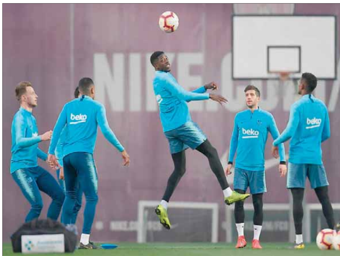
برشلونة يستعد لمواجهة إسبانيول في ديربي كاتالونيا (أ.ف.ب)

أريكسن، والإنجليزي هاري كين، والهولندي ماتياس دي ليخت. وقال زيدان بعد تعيينه مطلع بيل، والظهير الأيسر البرازيلي بالناكيد، للسنوات المقبلة. سيكون لدينا الوقت للحدث مع الرئيس ومع النادي حول ما ستقوم به».