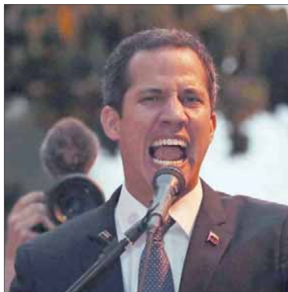
زعيم المعارضة خوان غوايدو يدعو إلى احتجاجات جديدة اليوم السبت

ظهر يوم الاثنين هو «هجوم إرهابي» على منشأة جويي الكهرومائية، التي تمد معظم أنحاء البلاد بالكهرباء. وأنحى مادورو بالمسؤولية في الانقطاع الأول على «هجوم إلكتروني» شنته الولايات المتحدة، لكنه قال أمس الأربعاء،