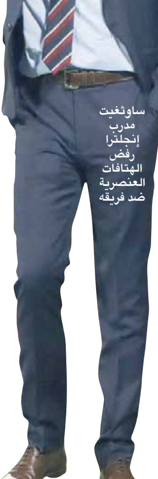
ساوثغيت مدرب إنجلترا رفض الهتافات العنصرية ضد فريقه

شارك نجم أياكس أمستردام الشاب ديفيد نيريس في مباراته الدولية الأولى مع منتخب البرازيل يوم الثلاثاء الماضي. ورغم أن اللاعب البالغ من العمر 22 عاماً قد عارض متوتراً خارج الملعب، فإنه