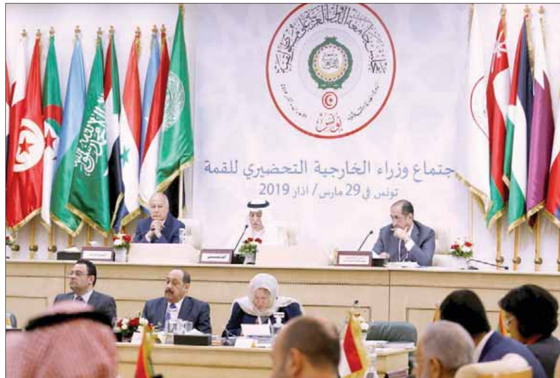
وزير الخارجية السعودي إبراهيم العساف خلال مشاركته في الاجتماع الوزاري بتونس أمس والي يمينه الأمين العام للجامعة العربية أحمد أبو الغيط وإلى يساره وزير الخارجية التونسي

ودعا إلى إيجاد حل سياسي في ليبيا يؤدي لتحقيق الاستقرار هناك من خلال مساعدة الأشقاء الليبيين على تجاوز خلافاتهم. وقال إن تونس ماضية في إطار المبادرة الثلاثية بالتنسيق مع مصر والجزائر من أجل تكريس حل ليبي - ليبي للآزمة وهي تدعم جهود المجتمع الأممي الدكتور غسان سلامة لإيجاد تسوية في ليبيا. وأشار إلى الوضع في سوريا وما شهدته خلال السنوات الماضية من دمار غير مسبوق ونزوح ملايين اللاجئين الأمر الذي يؤكد أهمية العمل على تسوية سياسية تمكن من الحفاظ على وحدة سوريا ومناعتها وتضع