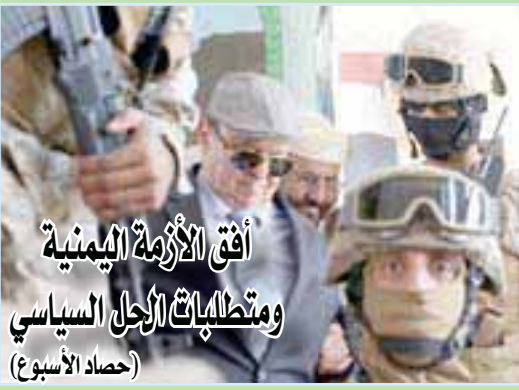
أفق الأزمة اليمنية ومتطلبات الأجل السياسي (حصار الأسبوع)