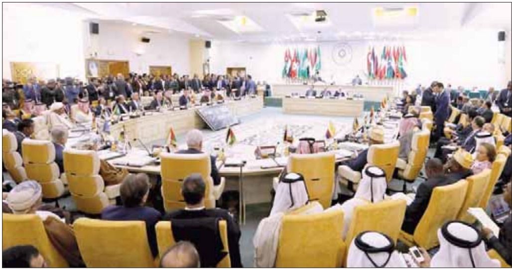
جانب من اجتماعات وزراء الخارجية العرب في تونس أمس

وإعادة الأمن والاستقرار لجميع المحافظات اليمنية، ودعم تنفيذ ما تم الاتفاق عليه في السويد، كما سيتم إعادة التأكيد على الالتزام بالحفاظ على وحدة اليمن وسيادته واستقلاله وسلامة أراضيه ورفض أي تدخل في شؤونه الداخلية، والتمسك بالمرجعيات الثأل: المبادرة الخليجية والبيها التنفيذية ومخرجات الحوار الوطني الشامل وقرار مجلس الأمن 2216 والقرارات الدولية ذات الصلة، كأساس للوصول إلى تسوية سياسية شاملة في اليمن.