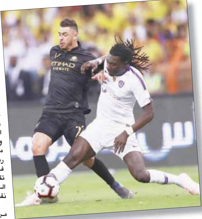
جانب من المواجهة التي جمعت النصر والهلال أمس

ونجح لويس جوستافو في تسجيل هدف الفوز في الدقيقة الأولى من الوقت المحتسب بدل الضائع، حيث تلقى تمريرة طويلة أنفرد على أثرها بمرمى القرني ووضع الكرة في الشباك. وتختتم منافسات الجولة مساء اليوم ببقاء وحيد، حيث يطمح الشباب في استعادة المركز الثالث عندما يدخل ضيفاً على أحد متدبل الغرثيب، ويمتلك الضيوف 44 نقطة في المركز الرابع، ولن يرضى الروماني ساموديكيا المدير الفني مدرب الشباب بغير العلامة الكاملة للحفاظ على حظوظه في خطف إحدى البطاقات المؤهلة لدوري أبطال آسيا في النسخة القادمة، بينما سيحتضن أصحاب الأرض والجمهور عن النقط الثلاث لبلوغ النقطة 18 والتغسل بامل البقاء بين الأندية الكبيرة.