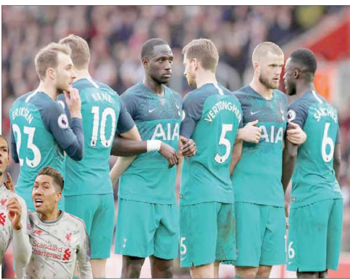
توتنهام اكتفى بنقطة واحدة من مبارياته الأربع الأخيرة

وفي المباريات الأخرى، يلعب اليوم كريستال بالاس مع هيدرسفيلد، وليستر سيتي مع بورنموث، وبرايون مع ساوثهامبتون، وبييرلي مع ولفرهامبتون، وستهام مع إيفرتون.