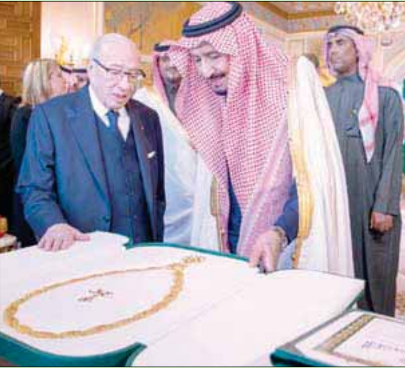
الملك سلمان والرئيس السبسي يتبادلان وسام الجمهورية التونسية وقادة الملك عبد العزيز