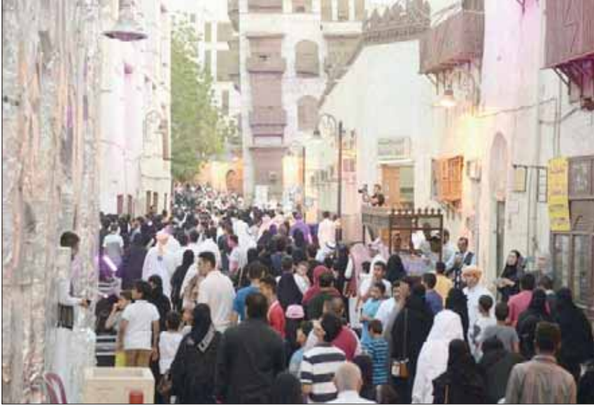
مهرجان «البحر الأحمر السينمائي الدولي» سيقام في جدة التاريخية