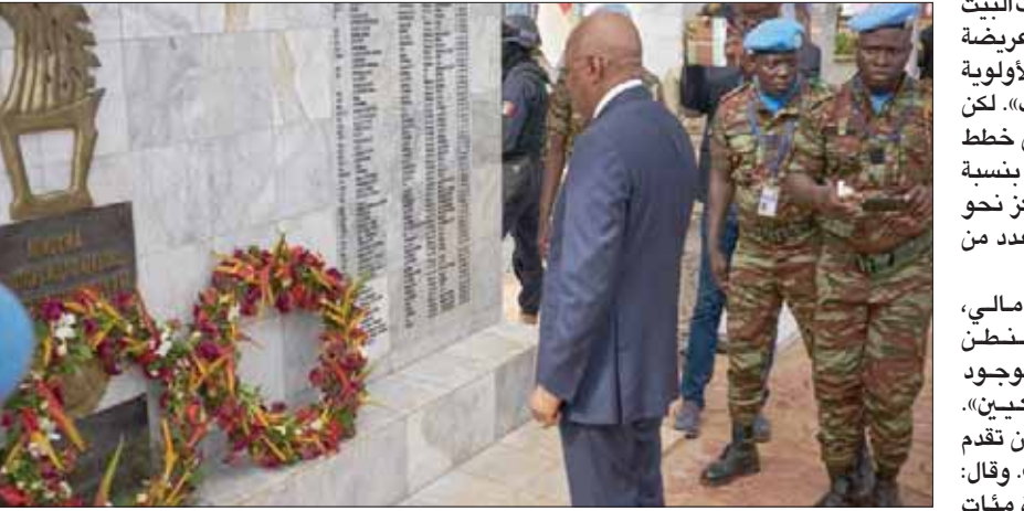
رئيس وزراء مالي يزور نصباً تذكاريًا في بلاده لضحايا قوات الأمم المتحدة التي تحارب الإرهابيين

الإنخراط نفسه في منطقة الساحل كما تفعل في الشرق الأوسط». وأضاف: «أمن مالي هو المفتاح الأساسي للأمن الدولي». وقالت الصحفية، على لسان مسؤول أمريكي: «نشرت الجماعات المتطرفة، بما في ذلك بعض الجماعات المرتبطة بتفريقي (داعش) والقاعدة، الفوضى في أجزاء كثيرة من غرب أفريقيا ومنطقة الساحل». وأشار المسؤول إلى أنه في عام 2012، تسلس المتطرفون المرتبطون بـ«القاعدة» إلى مالي، وسيطروا على بعض أراضيهما، حتى تدخلت القوات الفرنسية، وطردتهم، «لكن بقيت أجزاء من مالي معقلاً للمتطرفين».