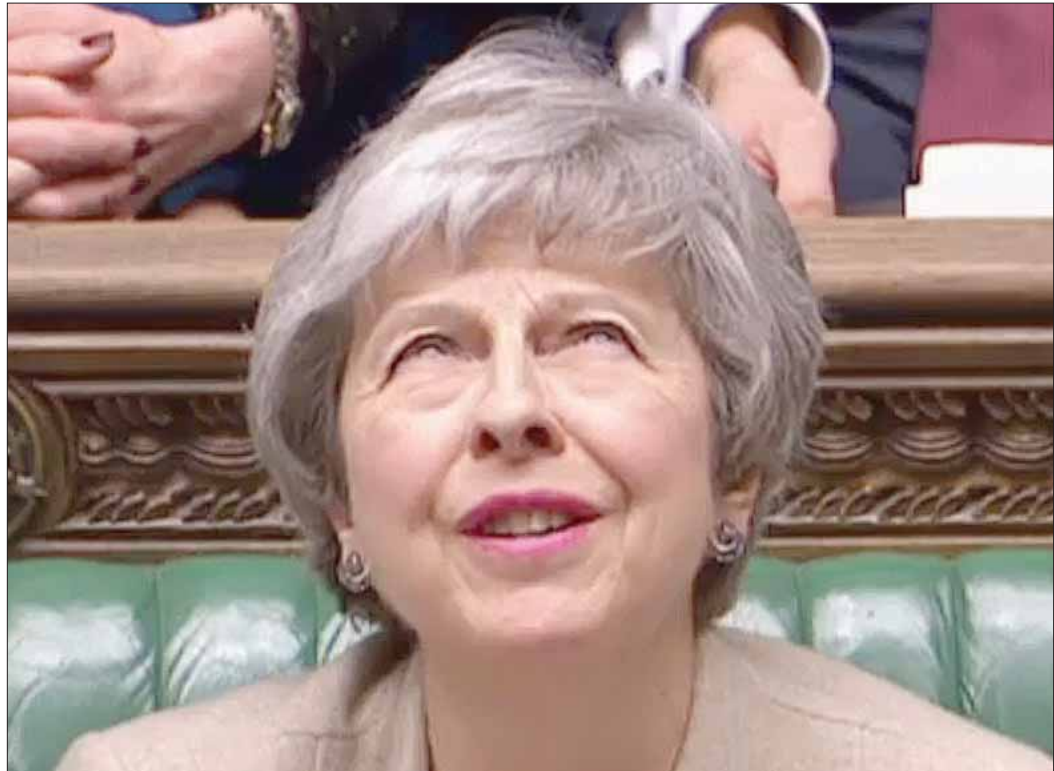
ثالث هزيمة لخطة تيريزا ماي للخروج من الاتحاد الأوروبي (أ.غ.ب)

الأعضاء الـ 27 خلال القمة الاستثنائية. وقالت رئيسة الوزراء البريطانية التي تحاصرهما المشاكل، إنها ستسعى لإيجاد «طريق بديل للمضي قدماً» لخروج بلادها من الاتحاد الأوروبي. وعقب التصويت، قالت ماي إن نتيجة التصويت تدعو إلى «الأسف العميق»، محذرة من أنه ستكون لها عواقب «خطيرة». وقالت ماي إن «هذا وقت غير كاف للموافقة، والتشريع، والتصديق على أي اتفاق، ومع ذلك، أوضح المجلس أنه لن يسمح بخروج من دون اتفاق». وأضافت: «ولهذا سبتعين علينا الاتفاق على طريق بديل للمضي قدماً». وتجاهلت ماي الدعوات من جانب زعماء أكبر حزبين معارضين وهما حزب العمال والحزب الوطني الإسكتلندي بالاستقالة من منصبها فوراً، والسماح بإجراء انتخابات عامة. وقالت إن النواب سيستمرون يوم الاثنين في «بحث ما إذا كانت هناك أغلبية ثابتة لصيغة بديلة معينة لعلاقتنا المستقبلية