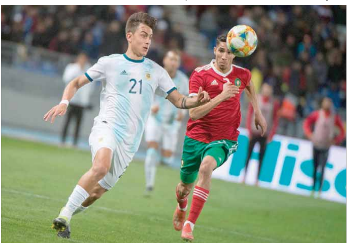
ديبالا وأداء سيئ من الأرجنتين في مواجهة المغرب

لا يوجد أدنى شك في أن مسيرة أندري روبرتسون يجب أن تكون مصدر الإلهام لكل لاعب شاب أو مكافح في اسكتلندا. وكانت مسيرته في مسار تصاعدي واضح للدرجة التي جعلت المدير الفني لمنتخب اسكتلندا، أليكس ماكليس، الذي يسعى إلى ضيق دماء جديدة في صفوف المنتخب الوطني، يعزّز منح شارة القيادة لروبرتسون العام الماضي. ويواجه منتخب اسكتلندا مخاوف ومشكلات أكبر من هذا الأمر بكثير، لكن من الواضح أن هذه المسؤولية تؤثر بشكل واضح