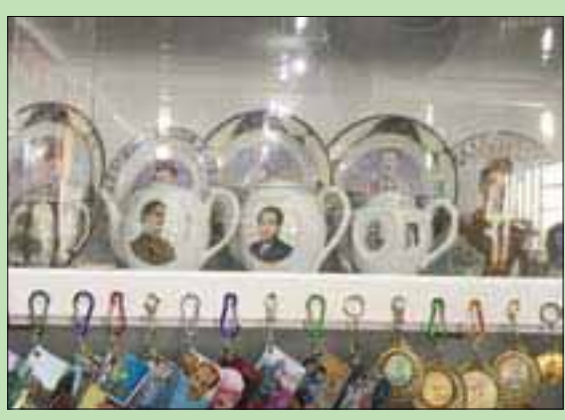
الثالث مهرجان هيت الثقافي الثالث بفرع العراق (التشرق الأوسط)

الفردية، وهو ما يشكل أقوى رد على هذا التنظيم الظلامي الذي حاول طوال السنوات التي سيطر فيها على المدينة مصادرة كل شيء إيجابي». وأضاف أن «تنوع فعاليات المهرجان وكذلك طبيعة المشاركة التي شملت معظم محافظات العراق ودعوة شعراء وكتاب وفنانين ومثقفين عكس جانباً آخر من جوانب عودة الحياة الطبيعية مثلما هو واضح في هذا الحضور الكثيف للجمهور من أبناء القضاء».