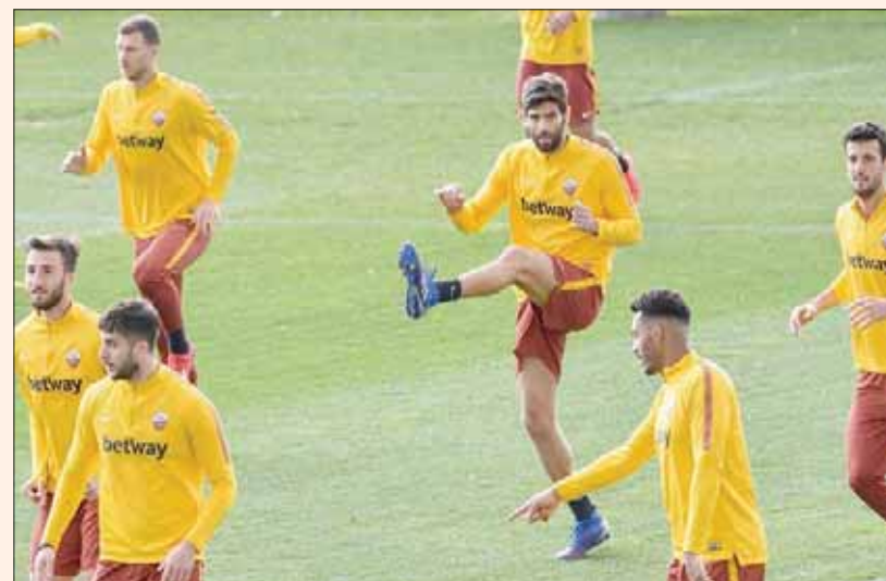
روما يستضيف نابولي ويعينه على أوروبا (أ.ف.ب)

صاحب المركز الخامس في ترتيب الدوري الإيطالي لكرة القدم، وهو يحتاج إلى فوز «غال» على ضيفه نابولي الثاني وصيف البطل غدا الأحد في المرحلة التاسعة والعشرين للحفاظ على أمله بالمشاركة في دوري أبطال أوروبا الموسم المقبل. وسيكون اللعب الأولي في العاصمة مسرحا لقمة هذه المرحلة التي تأتي بعد استراحة دولية وتشهد أيضا مباراة مهمة بين إنترميلان الثالث وضيغه لانسو السادس.