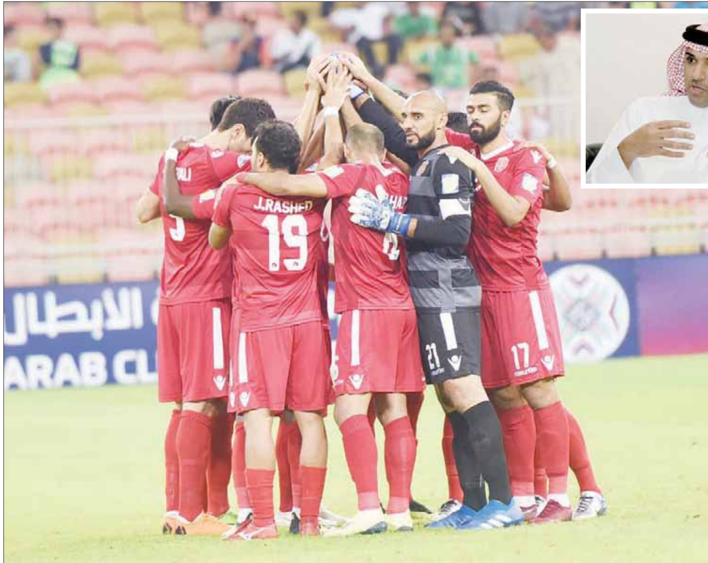
المحرق البحريني بات قريباً من المشاركة في الدوري السعودي