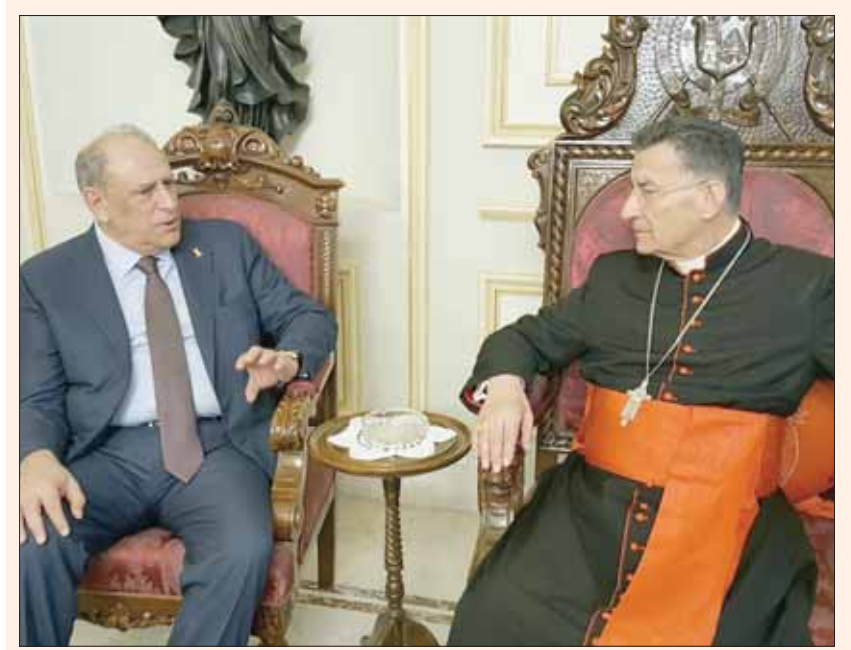
البطيرك الراعي مستقبلاً الوزير الجراح أمس

بيروت، الشرق الأوسط، أسف وزير الإعلام جمال الجراح لغياب أي مؤشر في البيان اللبناني الروسي المشترك يدل على الجدية في حل مشكلة النازحين، وقال إن خطة الكهرباء تقارب بموضوعية، أملاً أن يتم إقرارها في جلسة الحكومة الأسبوع المقبل، ودعا إلى اعتماد آلية واحدة في التعيينات. وإثر لقائه البطريرك الماروني بشارة الراعي بعد اجتماعه برئيس «حزب القوات» سمير جعجع، أوضح الجراح: «هناك قضايا مطروحة اليوم في البلد، وهي إصلاحية وسياسية، إضافة إلى قضية النازحين. ونحن لدينا حرص على الاستماع إلى كل الآراء والمقاربات لما فيه مصلحة لبنان لتوحيد الرأي في النهاية حول القضايا الوطنية». وعن موقع «تيار المستقبل» في ملف الكهرباء، قال: «الخطة قيد الدرس، ويفترض أن يكون الموضوع في جلسة مجلس الوزراء المقبلة، وحتى الآن كل الأمور تقارب بإيجابية وموضوعية وبنقاش جدي، على أمل أن تفر في الجلسة المقبلة بشكل نهائي وترفع إلى مجلس الوزراء لإقرارها إذا تم الاتفاق عليها، وبالتالي تبدأ الخطوات العملية». وعن التعيينات قال الجراح بعد لقائه جعجع بحضور وزير البيان المشترك لمحم رياشي: «إما أن تعتمد الآلية الواحدة في جميع التعيينات أو لا تعتمد، وحتى الآن لا قرار نهائياً». وعن ملف النازحين قال: «موقفنا واضح في هذا الملف وهو مع عودة النازحين، في الضرورية التي يجب أن يتخذها النظام السوري من أجل تسهيل هذه العودة، باعتبار أنه ليس نحن من عليه اتخاذ الأليات، لأننا لا نمنع أحداً من العودة.