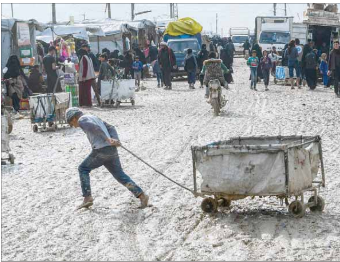
نازح من مخيم الهول شرق سوريا (أ.ب)

وأضاف أن القرار الأميركي لا يسهم في السلام والاستقرار الإقليميين، وعلى العكس من ذلك فهو يخلق اضطرابات وفوضى في المنطقة. من جانبه، قال لافروف إن روسيا أيضاً لم تعترف بالقرار، قائلاً: «هذا مخالف للقانون الدولي. جميع أشكال القانون الدولي انتهكت».