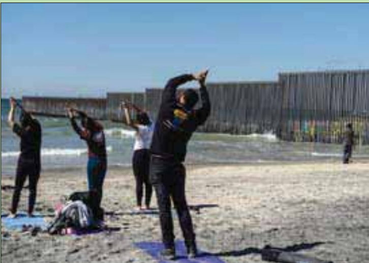
«اليوغا» تؤدي إلى انخفاض ضغط الدم

وكبير الباحثين في الدراسة: «لا تظهر نتائجنا فقط أن (اليوغا) قد تكون في فعالية التمرينات البدنية في خفض ضغط الدم، بل تشير أيضاً إلى أهمية ممارسة تمرينات (اليوغا) للتخفف والاسترخاء العقلي والتأمل، إلى جانب الحركات». إلا أن الباحثين كتبوا في دورية «مايو كلينيك» بروسيدنجز» أنهم لم يحصلوا على بيانات عن كيفية ممارسة (اليوغا)، بما في ذلك الفترة