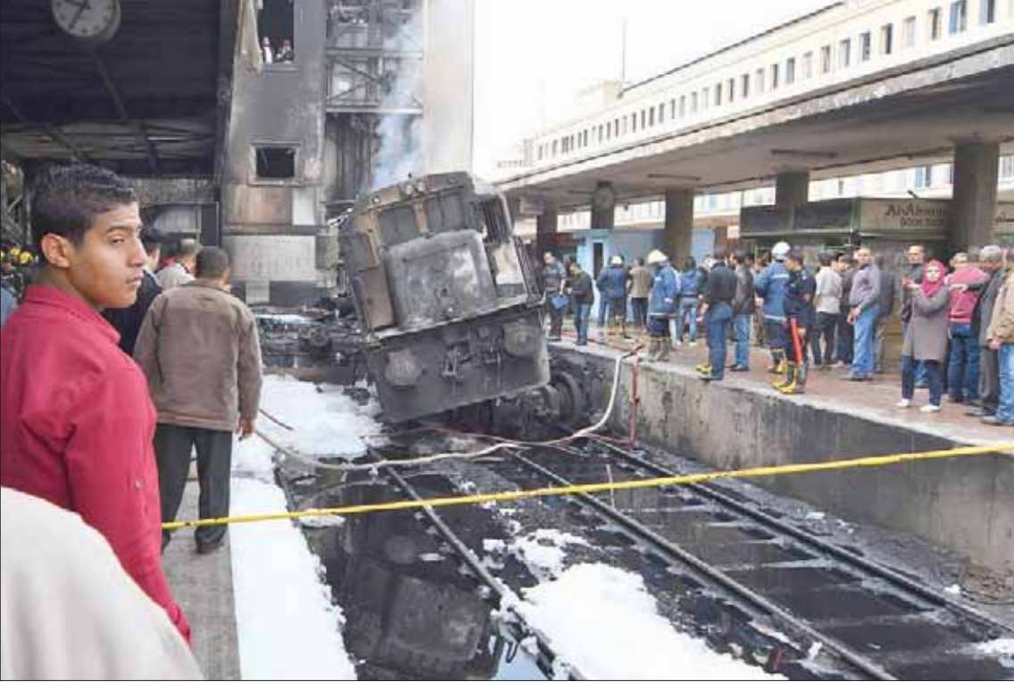
مشهد للقطار المحترق عقب حادث الاصطدام بمحطة مصر