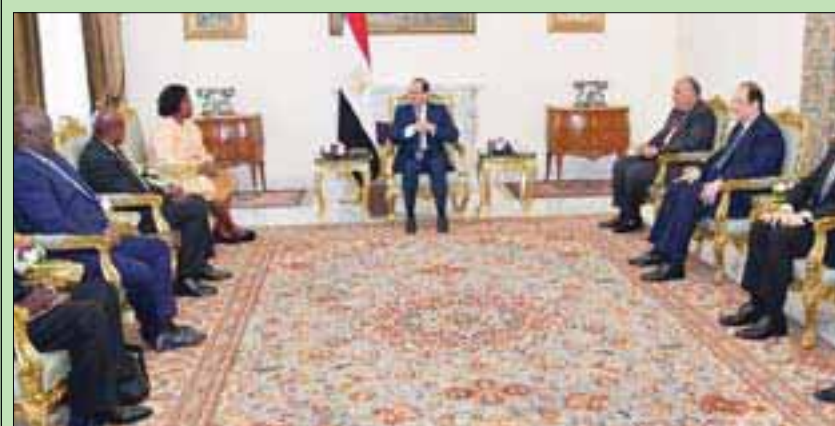
السيسي خلال اللقاء مع الوفد الكيني

أكدت مصر وكينيا حرصهما على تعزيز التعاون الثنائي في كافة المجالات، وعلى رأسها الأمنية والاقتصادية، وعقد لجنة مشتركة بين البلدين، خلال العام الجاري، في إطار رئاسة مصر للاتحاد الأفريقي عام 2019.