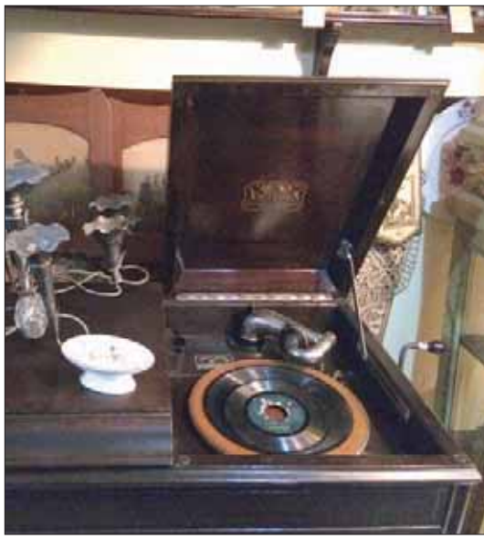
«غرامفون» لتشغيل الأسطوانات