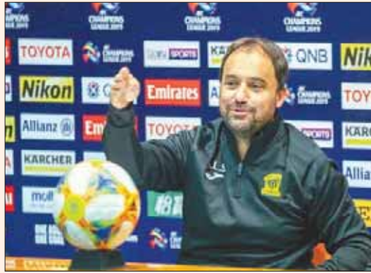
سييرا خلال المؤتمر الصحفي أمس

بولنت أويغون مدرب الريان إلى عزم فريقه تحقيق الفوز سواء بحضور الجماهير أو بدونه، منوهاً على امتلاك منافسه الاتحاد لاعبين مميزين ومعرفين ويذكر كذلك أن الفريق يوجد به عدد من اللاعبين المصابين، مشدداً أن نتائج الاتحاد في الدوري المحلي ليست مقياساً سهلة منافسه الذي يعتبر من الفرق القوية وخاصة بالمشاركات الآسيوية. وكان سييرا وضع اللمسات الأخيرة على المنهجية التكتيكية التي سيدخل بها مواجهته أمام الريان اليوم. وشرع مدرب الاتحاد خلال الحصص التدريبية الأخيرة يوم أمس والتي اقتصرها على مران خفيف تحضراً لإرهاق اللاعبين مع الريان لوجود جماهيره الداعمة بسبب تطبيق العقوبة الآسيوية المؤجلة من نسخة 2016 على النادي المتصنيف لمخالفة جماهيرية سابقة. وشدد مدرب الاتحاد خلال المؤتمر الصحفي أمس، على أنه سيتمحطولة دوري أبطال آسيا الأهمية التي تستحقها، مشيراً «نحن في مرحلة استشفاء بعد مباراة الدريري أمام الأهلي وسنواجه فريقاً جيداً وشاهدت مباريات الريان الماضية والفريق الآن يقع تحت ضغط المباريات ولم أكن أتمنى أن يخوض الفريق مباراة الريان دون جماهير، ولكن سننعمل مع الوضع ونقدم الأداء المنتظر». وكشف سييرا، عن أن طريقته الفنية تعتمد على التوازن بين الهجوم والدفاع، مبيناً أن الهجوم هو الوسيلة الوحيدة للانتصار، في ظل امتلاك الفريق عناصر جيدة على مستوى الدفاع والهجوم. واستطرد سييرا: أتمنى أن تكون الخيارات متعددة في اللاعبين الجاهزين وعملية تدوير المشاركة بين اللاعبين أمر جداً مهم خصوصاً في ظل الإصابات التي يعاني منها الفريق.