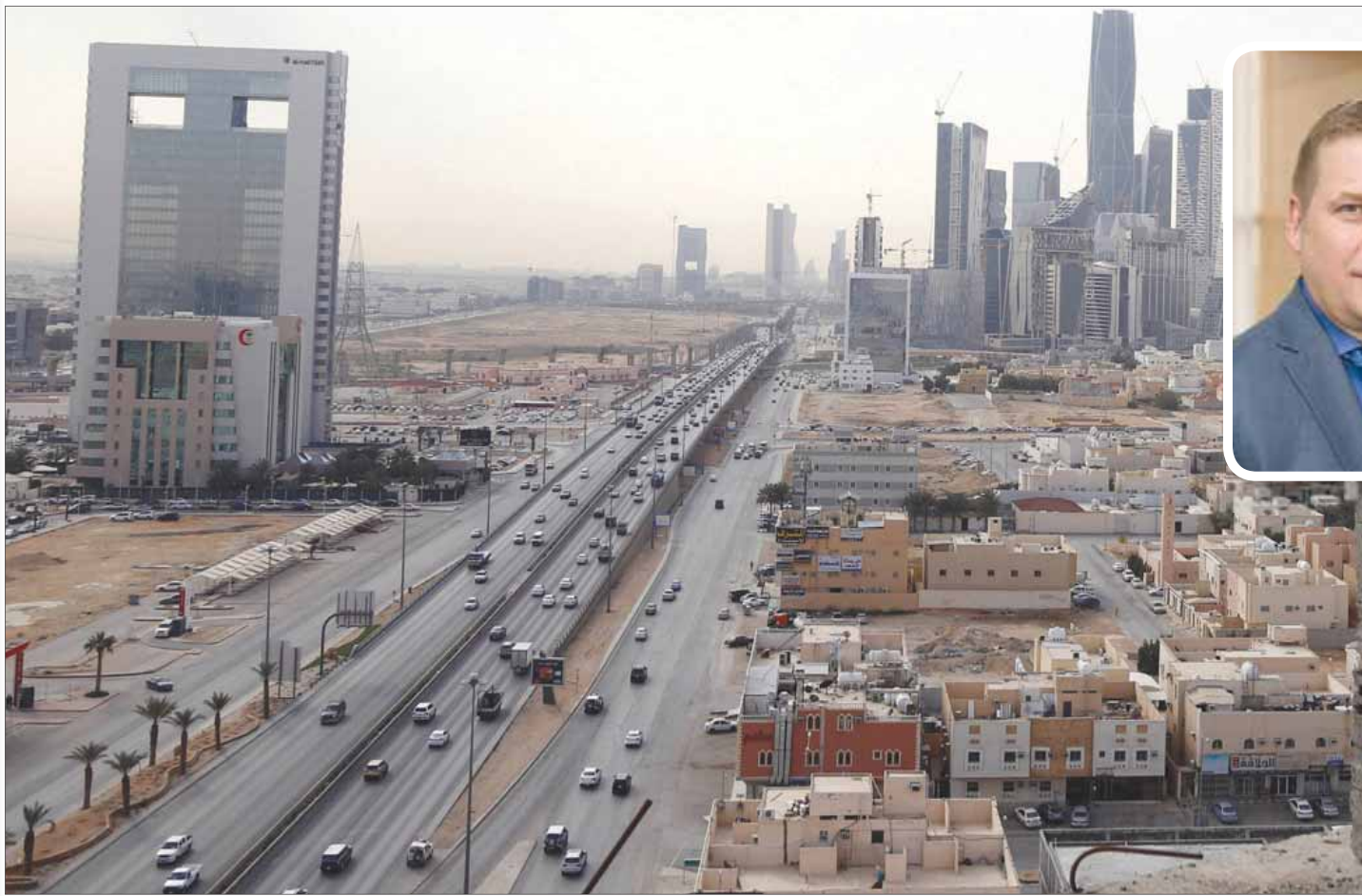
جانب من العاصمة السعودية

وتابع فورونكوف «في ديسمبر (كانون الأول) العام 2017 تم التوقيع على خارطة