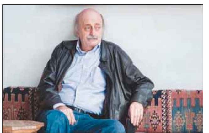
زعيم «التقدمي الاشتراكي» وليد جنابلاط

بيروت، «الشرق الأوسط» هناك، وأن نتبعد عن السجلات الجانبية».