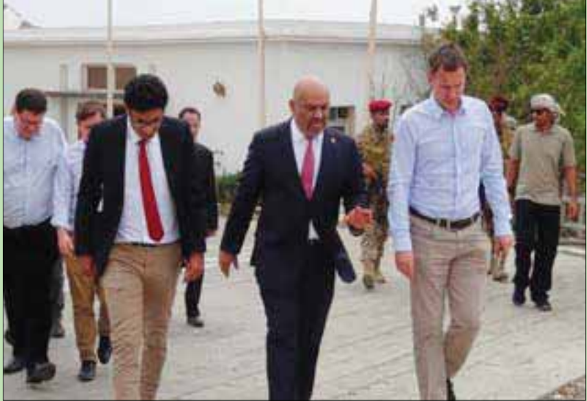
وزير الخارجية البريطاني مع نظيره اليمني في عدن أمس

عدن، علي ربيع زار وزير الخارجية البريطاني جيريمي هنت، أمس، عدن، في ختام جولته في المنطقة بهدف تعزيز فرص السلام في اليمن، والضغط على الميليشيات الحوثية لتنفيذ اتفاق استوكهولم. وفيما أبدى هنت، بعد مباحثاته مع نائب رئيس الوزراء اليمني أحمد سعيد الخنيسي ووزير الخارجية خالد اليمني، مخاوفه من عودة الأوضاع في اليمن إلى حرب شاملة بسبب عدم تنفيذ الاتفاق بين الحكومة الشرعية والجماعة الحوثية، لمح بيان رسمي من الخارجية البريطانية إلى أن جولة هنت في المنطقة قد تكون آخر فرصة لإنقاذ اتفاق استوكهولم وعملياته. وقال هنت في تغريدة على «تويتر» إن أفكاره تدور حول