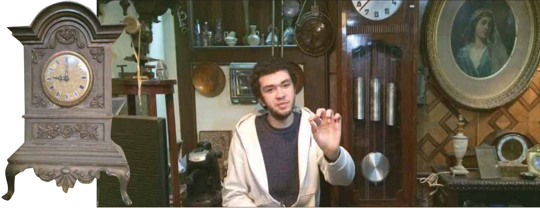
ساعة نادرة من النحاس