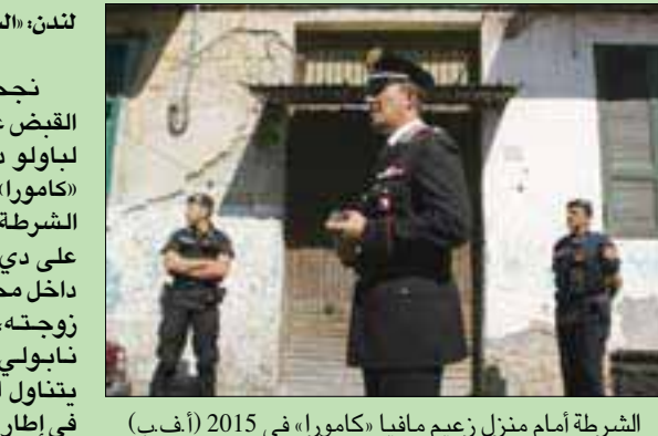
الشرطة أمام منزل زعيم مافيا «كامورا» في 2015