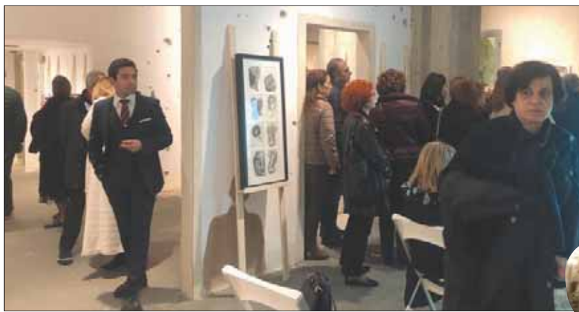
مشاعر متداخلة يترجمها الفنان التشكيلي ميشال عضيبي في لوحاته الفنية