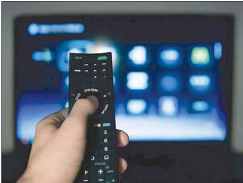
تتيح خدمات البث الرقمي مرونة للمستخدمين

بدور السينما، لافتاً إلى أن التغيير خلال عشر سنوات يوضح مدى سرعة تطور خدمات البث الرقمي. وبين أن أهمية خدمات البث الرقمي دفعت قنوات كبرى إلى توفير منصات رقمية للوصول إلى رغبات جماهيرها. وشدد على أهمية مراعاة الخصوصية في صناعة الأفلام وكتابة المحتوى، إذ إن بعض المنتجين يستخدمون قوالب متكررة لسرد القصة، مع الانتباه إلى إمكانية فرض حصص للمحتوى المحلي والإقليمي، والخصوصية الثقافية، والوقائع الثقافية والاجتماعية وإنتاج المحتوى. وعن دور البعد الثقافي في صياغة الموضوع، ذكر تجربة مسلسلات عدة من مختلف الدول، إضافة إلى الدور الثقافي في اختيار الأبطال، والدور الثقافي في قضايا الهوية والتمثيل.