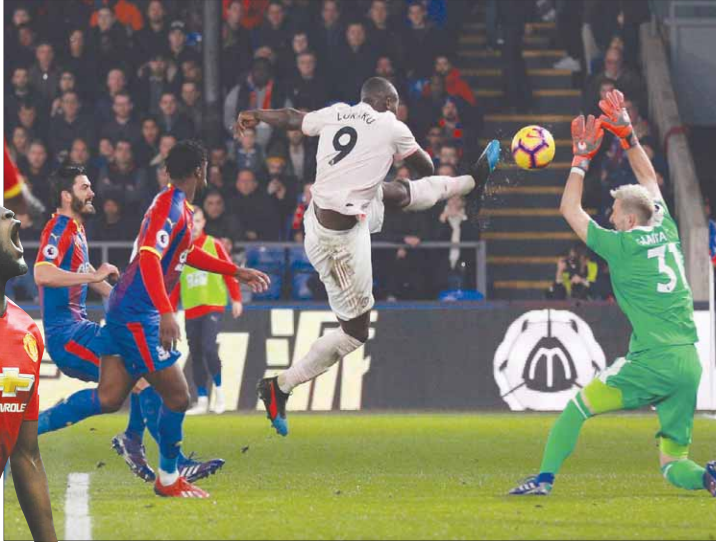
لوكاكو يسجل بطريقة رائعة في مرعى كريستال بالاس

ومع ذلك، هناك شيء مثير للقلق بعض الشيء فيما يتعلق بلوكاكو، وهو أنه دائماً ما يتعرض للانتقادات غير المنطقية، نظراً لأنه يبدو دائماً عاجزاً عن تقديم الأداء المتوقع منه، خاصة أنه يبدو تقنياً بعض الشيء عند أول لمسة للكرة، كما تبدو حركته في بعض الأحيان غير جيدة. علاوة على ذلك فإنه قد يهدر الكثير من الفرص والكرات السهلة أمام المرمى، كما فعل