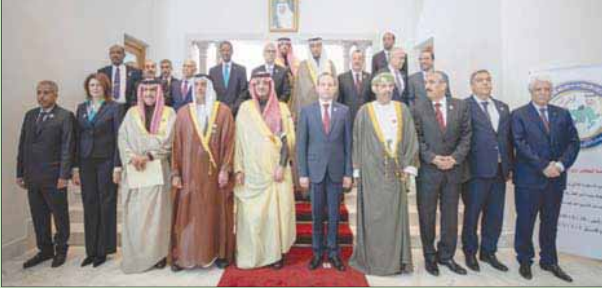
وزراء الداخلية العرب في صورة تذكارية بمناسبة اجتماعاتهم في تونس (واس)

شدد الأمير عبد العزيز بن سعود بن نايف وزير الداخلية السعودي الرئيس الفخري لمجلس وزراء الداخلية العرب، أن الإرهاب والتطرف يشكلان تهديداً مباشراً للعالم أجمع، وقال: «علينا السعي دون كلل أو ملل وبلا هوادة إلى تكثيف الجهود والتنسيق في التصدي القوي والفعال لهذه التهديدات، مع الاستمرار في العمل على تخفيف مناع تمويل الإرهاب والتطرف، بما في ذلك مكافحة جرائم غسل الأموال».