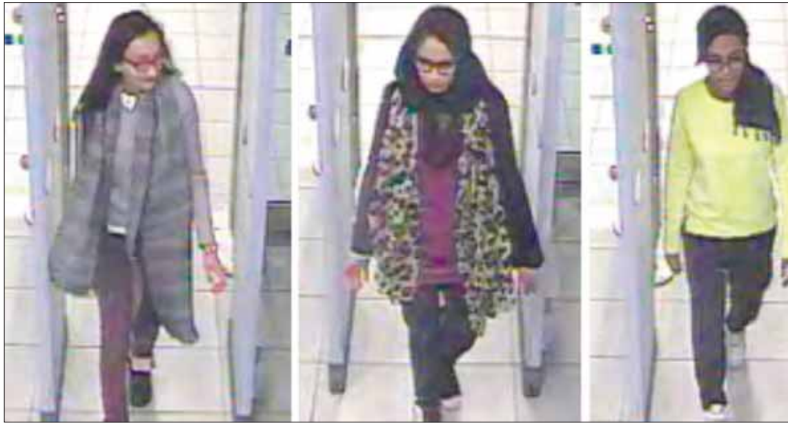
ثلاث مراهقات بريطانيات يغادرن لندن للانضمام إلى «داعش» في 2015

حال عودتهم إلى بلدانهم». وعكس ذلك بلا شك تراجع توقعات السلطات القادرة على إعادة تأهيل المقاتلين والتشكيك في صدق نياتهم، والقلق حيال قدرتهم على التأثير سلباً في مجتمعاتهم. وذلك لا ينطبق فحسب على من قاتل فعلياً في مناطق الصراع، بل شمل ذلك «العروس الداعشية» أو من قررت