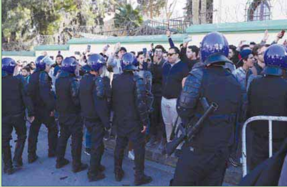
قوات الأمن في مواجهة متظاهرين ضد ترشح بوتفليقة لولاية خامسة أمام مقر المجلس الدستوري في الجزائر العاصمة أمس