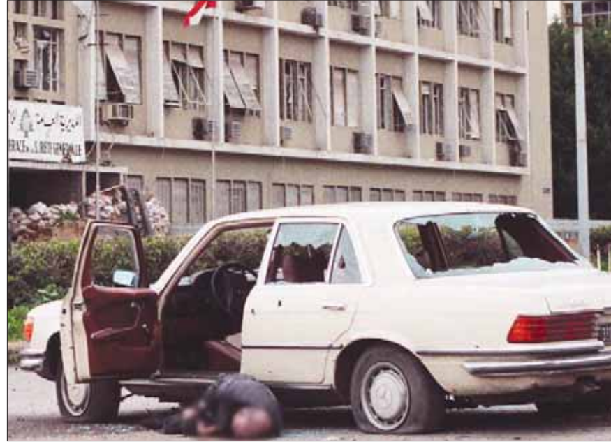
الطبيب الذي قُتل أثناء الاشتباكات بين الجيش اللبناني والقوات اللبنانية

«نحن صحفيون وأهم مهامنا أن نوثق تأثير العنف على العالم، وإذا تحدثنا نشر هذا النوع من الصور، فإننا نساهم في تقليل تأثير العنف وفي جعل الجدل بشأن الأمن والإرهاب غير دموي». وتقول لورام: «إن أحد الاعتبارات التي تضعها الجريدة في نشر صور كهذه، هو أهمية وضع الصورة على منصات التواصل وعلى شبكات التواصل الاجتماعي. وفي هذه الحال، لم نفضل نشر الصورة على حساباتنا على وسائل الإعلام الاجتماعية، لأنها كانت مزعجة للغاية. واستجابة لمخاوف القراء بشأنها، قررنا نقلها إلى موقع أقل بروزاً في المقالة». وجاء في الاتهامات أن الصحيفة الأميركية لا تطبق القواعد نفسها على تقاريرها في عمليات إطلاق النار الجماعية في الولايات المتحدة والهجمات الإرهابية في الغرب كما تفعل في أجزاء أخرى من العالم؟ إلا أن