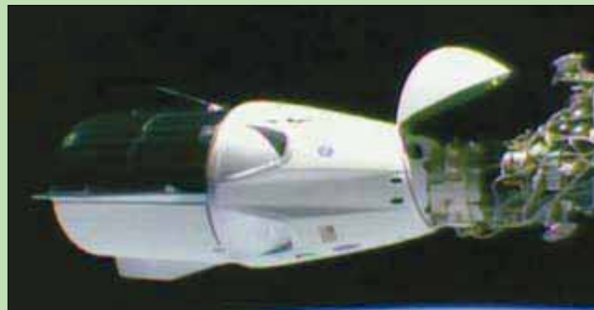
التحام كبسولة بمحطة الفضاء الدولية

دولار لصنع أنظمة صواريخ وكبسولات قادرة على المنافسة، ويمكنها نقل رواد الفضاء من الأراضي الأميركية للمرة الأولى منذ إحالة برنامج المكوك الأميركي للقتاع عام 2011. وتهدف الأنظمة إلى إنهاء اعتماد الولايات المتحدة على الصواريخ الروسية للوصول إلى محطة الفضاء الدولية، وهي مختبر للأبحاث في الفضاء على بعد نحو 402 كيلومتر عن الأرض، وتكلف بناؤها مائة مليار دولار. وتتكلف رحلة التوصيل الواحدة نحو 80 مليون دولار.