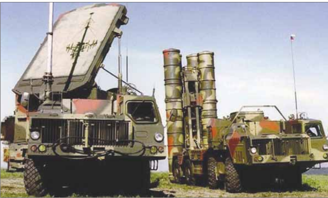
منظومة الدفاع الجوي الصاروخية «إس 300»

من جهة ثانية، وجهت أوساط مقرية من نتنياهو الاتهامات لما سمته ب«قادة أميين إسرائيليين يؤدون خدمتهم في الولايات المتحدة الأميركية». بانهم وجهوا رسائل لأعضاء مجلس الشيوخ الأميركي يحثونهم فيها على رفض مشروع قانون للاعتراف ب«السيادة الإسرائيلية على الجولان». وبحسب صحيفة «يسرائيل هيوم» اليمينية، أمس الأحد، فإن جهات في الأجهزة الأمنية الإسرائيلية في الولايات المتحدة فصلت عدم تمرير مشروع القانون المشار إليه، والذي عرضه السيناتوران الجمهوريان تيد كروز وتوم كوتون، الأسبوع الماضي. وقد طلبوا منهما بصراحة ووضوح «عدم تمريره، على الأقل في هذه المرحلة». وذلك لأن «الوجود الإسرائيلي في الجولان حقيقة لا يمكن التشكيك بها، ولذلك من غير الواضح ما الهدف من تمرير قانون سينشط النقاش حول الموضوع».