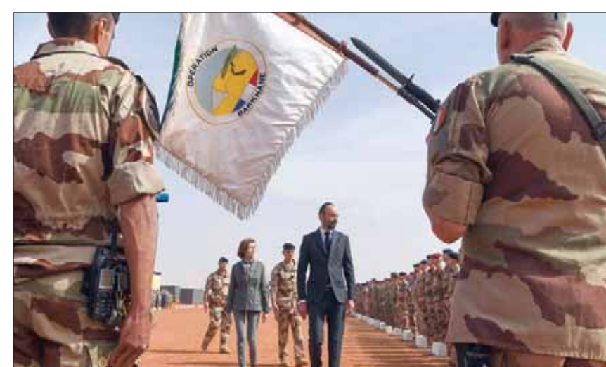
رئيس الوزراء الفرنسي إدوارد فيليب ووزيرة الدفاع فلورنس بارلي يستعرضان قوات بلديما في قاعدة «براكين» العسكرية الفرنسية بمالي نهاية فبراير في جزء من زيارة استغرقت يومين

في العام الماضي (2018) غير الفرنسيون من استراتيجيتهم، محاولين بذلك التغلب على أكبر نقطة ضعف عندهم؛ وهي أن تحركاتهم متوقفة، وأنهم ثقلوا الحركة بالمقارنة مع الجماعات الإرهابية السريعة والخفيفة، كما توجه الفرنسيون إلى إطلاق عمليات عسكرية معقدة وطويلة الأمد؛ إذ قد تمت العملية العسكرية الواحدة لأكثر من شهر، وفق تعبير قيادة أركان الجيش الفرنسي. لقد غير الفرنسيون خطتهم تماشياً مع التحولات التي عدهتها المجموعات الإسلامية المسلحة لتشكيل جماعة جديدة حملت اسم «نصرة الإسلام والمسلمين»، ويتولى قيادتها الزعيم الطارقي إباد أغ غالي، وقد وضع الفرنسيون أسماء قادة هذا التنظيم الجديد على رأس قائمة