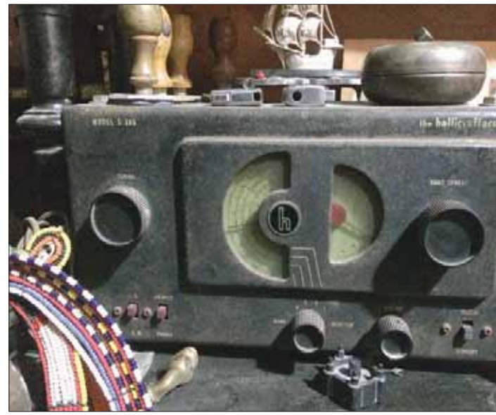
راديو أميركي نادر

الماضي، وما بعدها، إضافة إلى الأسطوانة الأصلية لأخر خطاب الرئيس جون كينيدي، الذي تم اغتياله في عام 1963.