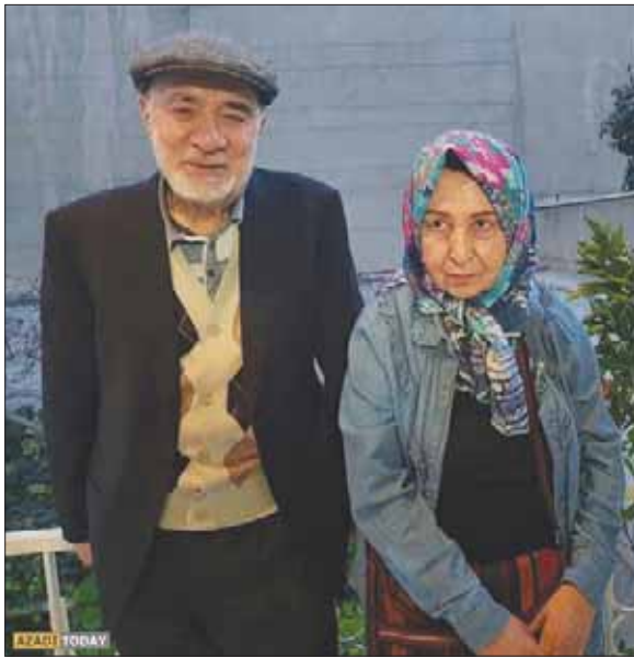
الصورة التي نشرها موقع «كلمة» لموسوي ورهونود

حسن روحاني ضغوطا من حلفائه الإصلاحيين نتيجة تعطل أبرز وعوده في انتخابات الرئاسة عام 2013 وانتخابات 2017، وهو رفع الإقامة الجبرية عن كروبي ومير حسين موسوي وزوجته ورفع القيود عن الرئيس الإصلاحي السابق محمد خاتمي.