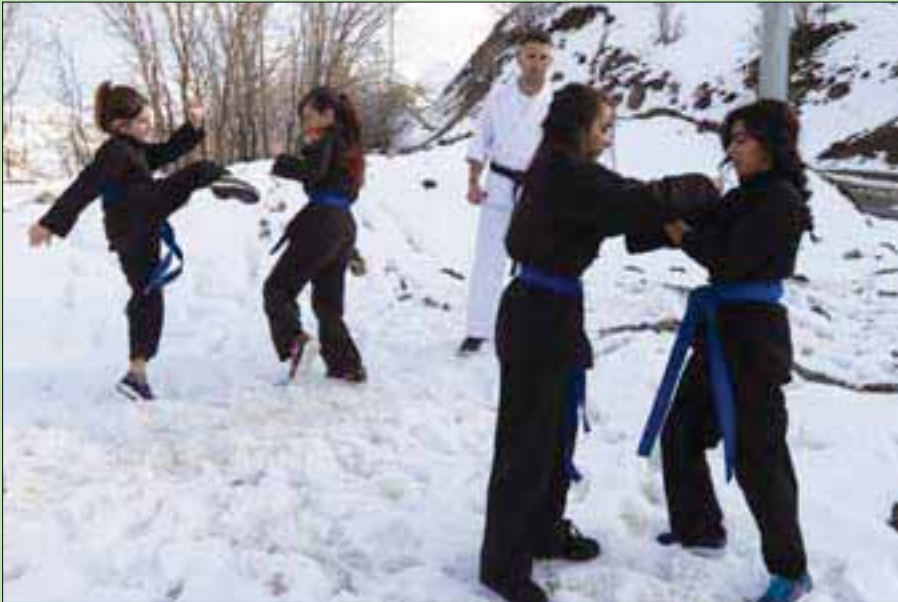
فتيات يلعبن الكاراتيه فوق جبل مغطى بالثلوج بالقرب من بنجوين في السلبيمانية

يذكر أن محاربي النينجا كانوا قد خاضوا في بلادهم حرباً ضروساً لإنقاذ العبيد وتحريرهم، فأصبحوا عنواناً للمحاربين الأحرار في كل العالم.