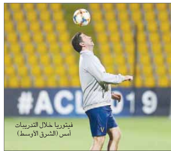
فيتوريا خلال التدريبات أمس (الشرق الأوسط)

وينتجح التركي مدرب الضيوف في أسلوبه الفني طريقة مشابهة تماماً للأسلوب الذي يعتمد عليه التشيلي سييرا مدرب الاتحاد بإغلاق المنافذ الخلفية والاعتماد على الكرات الطويلة المرسله خلف المدافعين من مناطق الفريق المنافس.