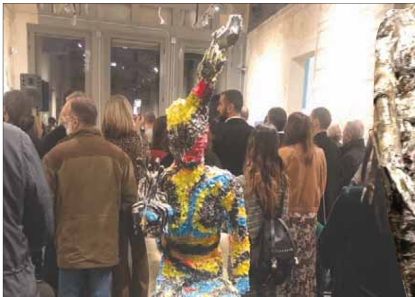
منحوتة «بيت بيروت» التي استوحاها الفنان ميشال عضيبي من مكان المعرض

استوحيتها مباشرة من (بيت بيروت) الشاهد على خطوط تماس فرقت بين أهل بيروت بالنار والرمصاص. فرغبت في تكريم هذا المكان على طريقي من خلال هذه القطعة الفنية المعبرة».