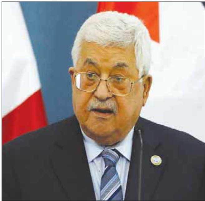
الرئيس الفلسطيني محمود عباس

حساب (خلية الإعلام)، ولم تغلقه نهائيا، ويبقى القرار بيديها، وهي المسؤولة عن ذلك، على الرغم من عدم وجود أسباب واضحة تتعلق بالإجراء الذي اتخذته». ويقول لجانها المختصة في حديث لـ«الشرق الأوسط»، «عموماً لا نظن أن الخلية ارتكبت خطأ فادحا يستوجب إغلاق الحساب بصورة نهائية». وحول ما إذا