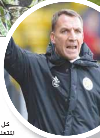
رودجرز مطالب بإثبات جدارته مع ليستر

ومع ذلك، كان يُنظر إلى رودجرز على أنه لم يحقق شيئاً استثنائياً مع سلتيك، الذي كان يهيمن على كرة القدم المحلية حتى قبل التعاقد معه. وبالتالي، يمكن بكل تأكيد تفهم مشاعر الغضب لدى جمهور النادي، بسبب الرحيل المفاجئ للمدير الفني الأيرلندي، خاصة أن هذا الجمهور كان يعيش رودجرز، ويقدم له دعماً كبيراً في كل المناسبات.