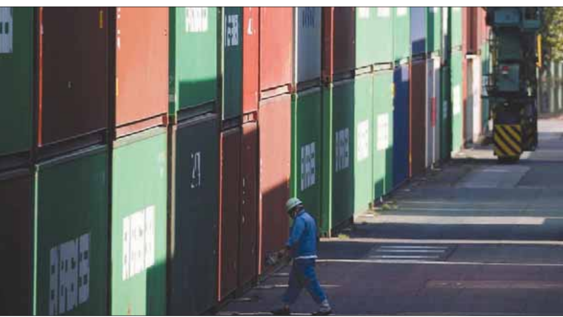
صورة أرشييفية من ميناء في طوكيو

الماضي بنسبة 8,4 في المائة سنوياً إلى 5,574 تريليون ين، في حين كان المجلدون يتوقعون تراجع الصادرات بنسبة 5,7 في المائة فقط بعد تراجع بنسبة 3,9 في المائة خلال ديسمبر (كانون الأول) الماضي. وقد تراجعت صادرات اليابان إلى الصين خلال الشهر الماضي بنسبة 17,4 في المائة، وهو ما أثر بشدة على الميزان التجاري لليابان، نظراً لأن الصين هي أكبر شريك تجاري لها في العالم. كما ارتفعت صادرات اليابان إلى الولايات المتحدة بنسبة 6,8 في المائة إلى 1.1 تريليون ين، في حين زادت الواردات اليابانية أيضاً من الولايات المتحدة بنسبة 7,7 في المائة إلى 772,1 مليار ين، لتسجل اليابان فائضاً تجارياً مع الولايات المتحدة قيمته 367,4 مليار ين. والفائض التجاري