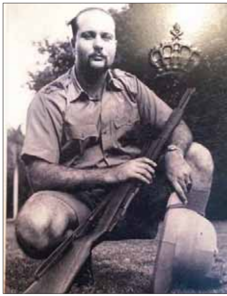
صور أصلية مختومة للملك فاروق