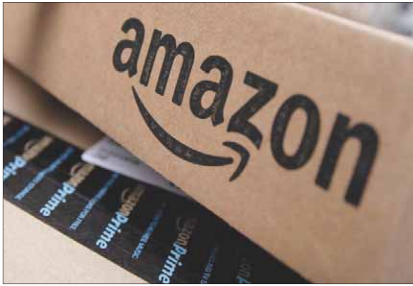
شركة أمازون واحدة من أبرز الكيانات في عالم التجارة الإلكترونية

والتي تهيمن على المستوى الدولي، وقد يكون الدافع وراء تحرك فرنسا لإدخال الضريبة بسبب مخاوف تتعلق بالميزانية المحلية، حيث تبحث وزارة المالية عن مصادر جديدة للإيرادات والمخدرات. وفي الوقت الذي تعترض فيه الحكومة الفرنسية فرض ضريبة محلية على متاجر التجزئة الإلكترونية، طالب الكسندر بومبارد الرئيس التنفيذي لشركة كارفور إس إيه، أن تتساوى منصات التجزئة الإلكترونية مثل علي بابا وأمازون في المعاملات الضريبية مع متاجر التجزئة الأخرى. وقال بومبارد لصحيفة «جورنال دو ديمانش»: «علينا أن ننهي الاختلالات التقيدية بين متاجر التجزئة مثلنا والمنصات العالمية الأمريكية أو الصينية». ونقلت وكالة بلومبرغ للأخبار عن بومبارد القول: «مع