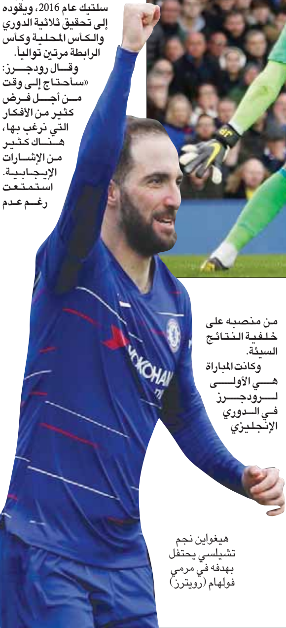
هيغواين نجم تشيلسي يحتفل بهدفه في مرعى فولهام

وامتدح خافي غارسيا مدرب وانفورد القائد ديني لتأثيره بعد أن رفع الفريق رصيده إلى 43 نقطة من 29 مباراة وتراجع بفارق الأهداف عن ولغرهامبتون صاحب المركز السابع. وقال غارسيا: «الجميع يعرف مدى أهميته بالنسبة لنا بسبب احترافيته وشخصيته وطموحه إضافة لتخصصه داخل وخارج الملعب. هناك 9 مباريات متبقية ونملك 43 نقطة... يمكنني أن أشعر بطموح المجموعة وأنهم يريدون المزيد». وأضاف: «أفضل الاستمتاع بكل مباراة وأن أبذل أقصى جهدي. هذه أفضل طريقة للاستمتاع بأشياء ذات خصوصية في النهاية».