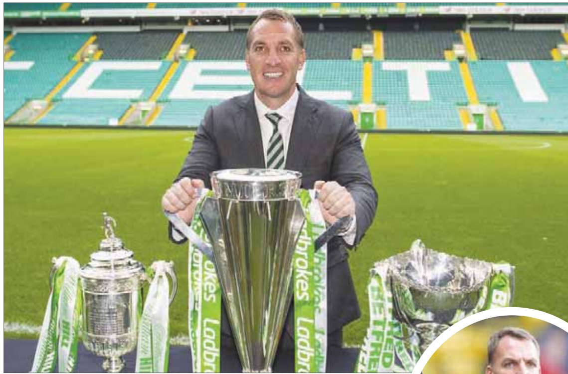
رودجرز هيمن على كل البطولات الاسكتلندية مع سلتيك

وخلاصة القول: هناك بعض الأمور التي لا يزال يتعين على رودجرز أن يثبتها، ولا سيما بعد رحيله عن ليفربول في ظروف سيئة، وكذلك في ظل فشله في تقديم أداء مقنع مع سلتيك على الساحة الأوروبية. ورغم أن رودجرز كان خياراً جيداً للغاية بالنسبة لنادي سلتيك، فإنه ليس هناك سبب واحد يدعو النادي الاسكتلندي للبقاء على رحيله.