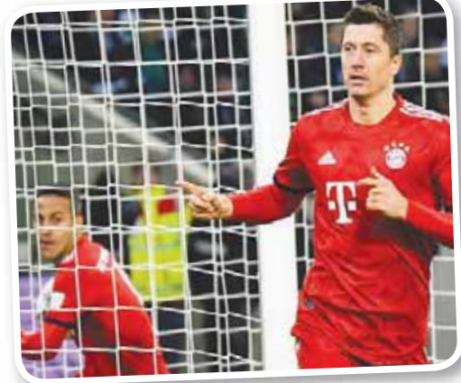
ليفاندوفسكي أصبح أكثر اللاعبين الأجانب تسجيلاً مع البايرن

وسجل ليفاندوفسكي 121 هدفاً لبايرن ميونيخ، ليتفوق على رولاند فولفارت الذي سجل 119 هدفاً في سجل أفضل هدافي النادي البافاري، ويصبح امامه