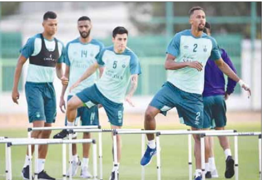
لاعبو الأهلي خلال تدريباتهم الأخيرة

جدة، محمد باسنيدي شدد الأوروغوياني فوستاتي، مدرب الأهلي، على لاعبيه بأهمية تحقيق النتائج الإيجابية في مباريات المجموعة الآسيوية التي تقام على أرضه، مطالباً الجميع بالاجتهاد والتركيز على العمل الفني في ظل ضيق الوقت الفاصل عن موعد المباراة التي تجمعهم بالسد القطري مساء غد الثلاثاء على ملعب «الجوهرة المشعة» بمدينة الملك عبد الله الرياضية بجدة في