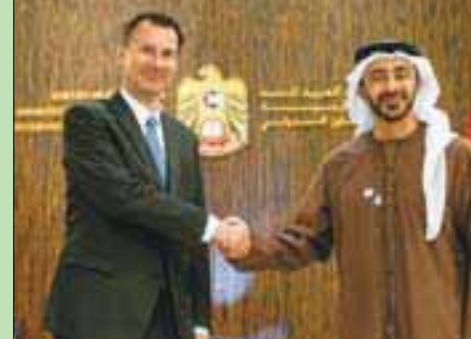
الشيخ عبد الله بن زايد وجيري مي هنت في أبوظبي أمس (وأم)

استقبل الشيخ عبد الله بن زايد آل نهيان وزير الخارجية الإماراتي، جيري مي هنت وزير الخارجية البريطاني، بحضور الدكتور أنور قرقاش وزير الدولة للشؤون الخارجية، والدكتور سلطان الجابر وزير دولة. وجرى خلال اللقاء بحث العلاقات الثنائية المتميزة بين البلدين الصديقين، وسبل تعزيز أوجه التعاون المشترك في المجالات كافة. كما تبادل وجهات النظر تجاه مستجدات الأوضاع في المنطقة، وبحثا عدداً من