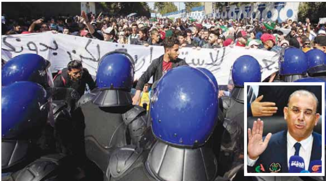
طلاب يتظاهرون ضد ترشح بوتفليقة في إحدى جامعات العاصمة أمس... وفي الإطال مدير حملته خلال مؤتمره الصحافي

ووعده بوتفليقة بـ«تنظيم ندوة وطنية شاملة جامعة ومستقلة مناقشة وإعداد واعتماد إصلاحات سياسية ومؤسسية واقتصادية واجتماعية، من شأنها إرساء أسس نظام إصلاحي جديد للدولة الوطنية الجزائرية، ينسجم كل الانسجام مع تطلعات شعبنا». ويعتبر ما تعهد به بوتفليقة في الرسالة «إعداد دستور جديد يُرتكبه الشعب الجزائري عن طريق الاستفتاء» يكرس مبادئ جمهورية جديدة ونظام جديد، ووضع سياسات عمومية عاجلة كقضية إعادة التوزيع العادل للثروات الوطنية، وبالنسبة على أوجه التهميش والإقصاء الاجتماعيين كافة، ومنها ظاهرة الحركة (الهجرة غير الشرعية)، بالإضافة إلى تعبئة وطنية فعلية ضد جميع أشكال الرشوة والفساد». وقال إنه سيخضع لإجراءات فورية وفعالة لجميع كل فرد من شبابنا فاعلاً أساسياً ومستفيداً ذا أولوية في الحياة العامة، على أن جميع المستويات، وفي كل فضاءات التنمية الاقتصادية والاجتماعية، ومراجعة قانون الانتخابات، مع التركيز على إنشاء آلية مستقلة تتولى دون سواها تنظيم الانتخابات. وأضاف أن «الانتخابات التي أقطعتها هي نفسنا المسمى، ستقودنا بطبيعة الحال في تعاقب سلس بين الأجيال، في