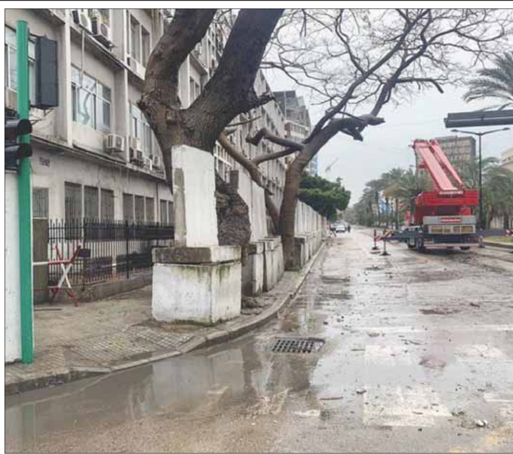
إزالة الجدار الإسمنتي أمام مقر الأمن العام في منطقة العيلية في بيروت