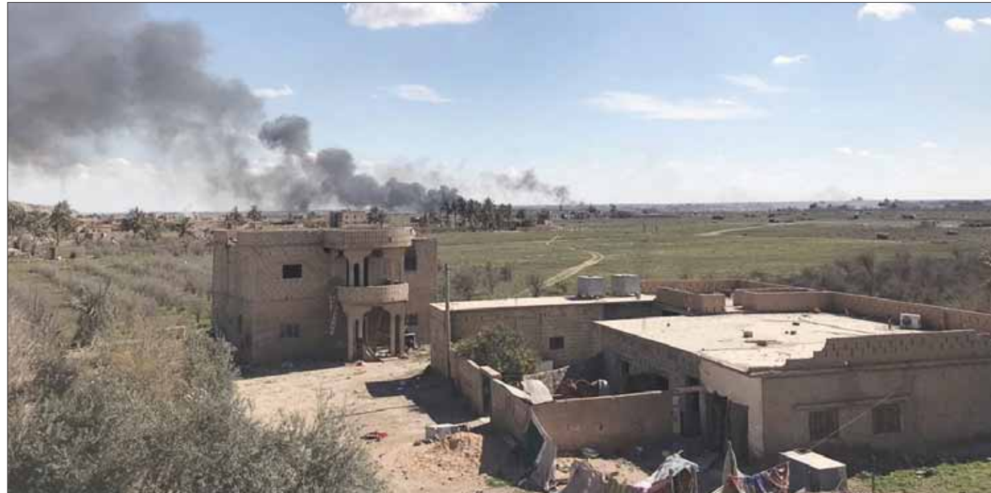
الباغوز (سوريا)، «الشرق الأوسط»

قال مقاتلون من قوات سوريا الديمقراطية المدعومة من الولايات المتحدة، إن تنظيم داعش، نفذ تفجيرات بسيارات ملغومة ضد القوات التي تهاجم الباغوز، في مسعى أخير لتجنب الهزيمة في آخر قطعة من الأراضي يسيطر عليها. وستتوج السيطرة على قرية الباغوز، الواقعة بشرق سوريا على ضفاف نهر الفرات، أربع سنوات من الجهود الدولية لطرد المتشددين من أراضي ما أسماها «دولة الخلافة» التي أعلنوها من جانب واحد وشملت نحو ثلث مساحة سوريا والعراق تقريبا في عام 2014.