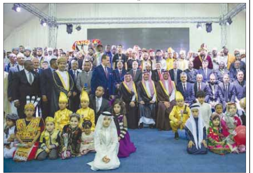
جانب من توشين أمير المدينة المنورة مهرجان الثقافات والشعوب في «الجامعة الإسلامية»

المدينة المنورة: «الشرق الأوسط» قال الأمير فيصل بن سلمان أمير منطقة المدينة المنورة، إن خادم الحرمين الشريفين الملك سلمان بن عبد العزيز، يؤكد باستمرار على أهمية البعد الإنساني المشترك، بعيداً عن مفهوم صدام الثقافات، ذلك أن البعد الثقافي يعد مُتَحَرِّزاً