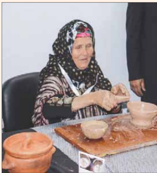
تونس، المتجي السعيداني

هي المرة الأولى التي تعرض فيها حرفيات منطقة سجنان (شمال غربي تونس) أعمالهنّ الإبداعية في مدينة الثقافة وسط العاصمة التونسية، إنها أعمال بسيطة تطغى عليها أشكال الطيور والخطوط المتشابكة بشكل هندسي يميل إلى العفوية منه إلى التعقيد.