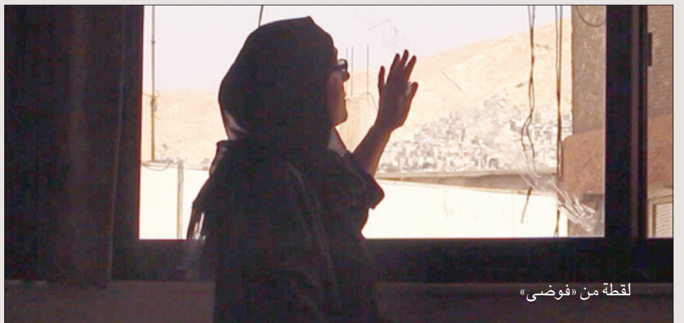
لقطة من «فوضى»