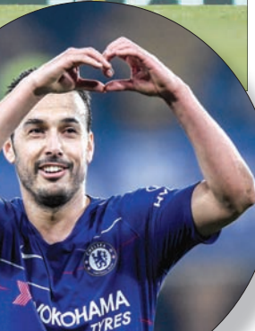
بيدرو نجم تشيلسي يحتفل بهدفه في مرمى توتنهام

وأشار المدرب الألماني إلى أنه كان سعيدا برد فعل لاعبين بعد أسبوع من الجدل حول تراجع المستوى، وقال: «لا أدخل إلى غرفة تبديل الملابس ليأتي شخص لإبلاغني