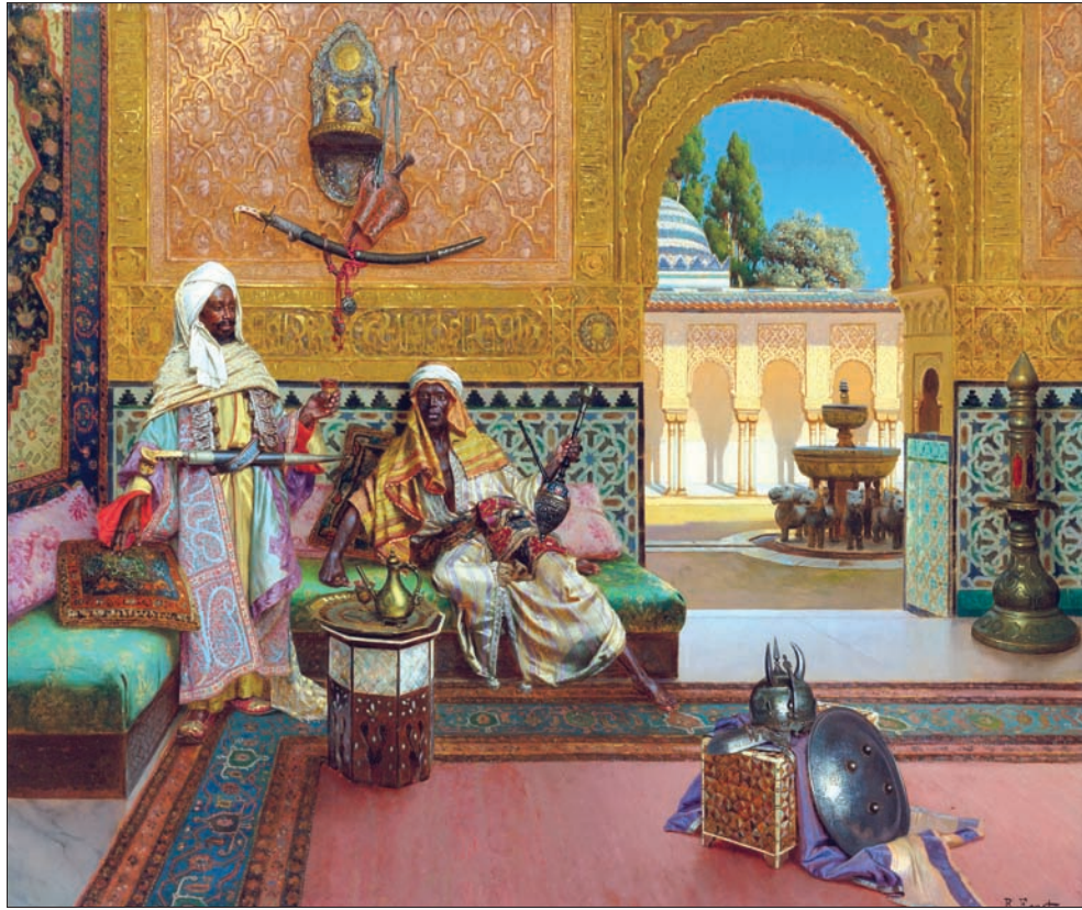
لوحة للفنان رودولف إرنست بعنوان «محاربيون في قصر الحمراء»