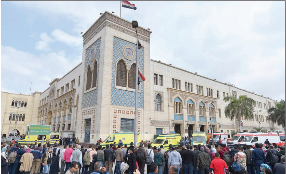
انتظام العمل في محطة مصر عقب حادث الجرار (أ.ب.أ)

تسعى الحكومة المصرية لرفع معدلات الأمان في منظومة السكك الحديدية، مع تكرار حوادث القطارات، كان آخرها انفجار جرار قطار بمحطة القاهرة، أول من أمس، قتيلاً. وشدد محمد شاكر، الملقب بتسيير أعمال وزارة النقل، بعد استقالة وزيرها هشام عرفات، على «ضرورة عدم خروج أي قطار أو جرار من الورش، إلا بعد التأكد التام من الحالة الفنية له، والالتزام التام بتعليمات السلامة المنصوص عليها».