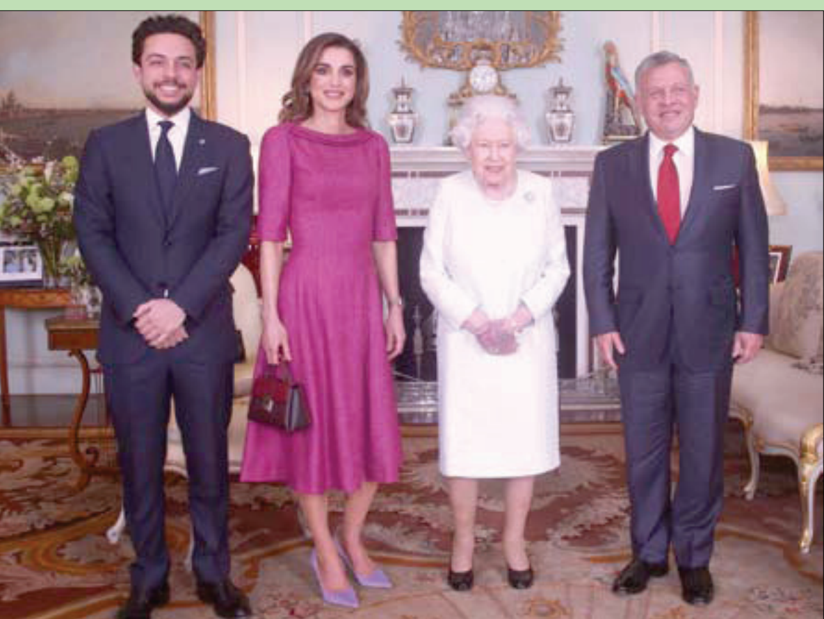
ملكة بريطانيا اليزابيث الثانية لدى استقبالها العامل الأردني الملك عبد الله الثاني وزوجته الملكة رانيا وولي العهد الأردني الأمير حسين في قصر باكنغهام بوسط لندن أمس

كشفت تسريبات مسجلة بين اثنين من كبار المسؤولين المواليين للرئيس الجزائري عبد العزيز بوتفليقة، مدى استعداد النظام لاستخدام القوة ضد الرافضين للتجديد للرئيس. وتابع الجزائريون باهتمام كبير على المنصات الرقمية الاجتماعية، أمس، أطوار المحادثة التي جرت بين عبد الملك سلال مدير حملة الرئيس، وعلي حداد رئيس أكبر كتل لرجال الأعمال، إذ قال سلال في المحادثة إنه سيتوجه (اليوم) الجمعة إلى مدينة عين وسارة في جنوب البلاد وفي حال صافى في طريقه متظاهرين «وأطلقوا علينا النار بكلاشنيكوف، فسنطلق النار ونحن أيضاً... أين المشكلة!» وكان يقصد أنه سيكون محاطاً برجال الدرك، وأنهم سيتصدون لأي متظاهرين إذا اعتدوا على موكبه. وقال حداد لسلال: «الجماعة مفتاحون من أن تمتد المظاهرات»، فقال سلال لها: «لن تذهب إلى هناك ولن تمتد»، وطلب حداد ضرورة الصمود حتى تاريخ 3 مارس (آذار) موعد إيداع ملف ترشح بوتفليقة، قائلاً: «هذا هو عملنا الآن»، ليحجبه سلال: «هم يظنون أن بوتفليقة سينسحب بكل سهولة». وتزامن هذا التسريب مع تصريحات لرئيس الوزراء الجزائري أحمد أويحيى رفع فيها ما وصفه معارضون بـ«فراغ» تكرار السيناريو السوري في الجزائر». وقال أويحيى في البرنامج أمس: «لقد سمعت من يقول إن المحتجين سلموا وروداً لرجال الشرطة. لكن في سوريا أيضاً بدأت الأحداث بورد، وانتهت بانهار من الدماء». (تفاصيل ص 8)