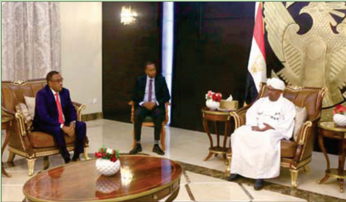
الرئيس السوداني خلال لقائه نائب رئيس وزراء أثيوبيا في الخرطوم أمس

الاقتصادية، والغلاء الفاحش في أسعار الخبز والسلع الرئيسية، والدواء، بيد أنها تطورت إلى احتجاجات سياسية تطالب بتنحي الرئيس عمر البشير وحكومته على الفور، وتكوين حكومة كفاءات انتقالية. وتصدى «تجمع المهنيين السودانيين» لتخطيم الاحتجاجات وقيادتها وجذولتها، وهو تنظيماً نقابي يضم أطباء ومهندسين وصيادلة ومحامين وصحافيين، ومنها أخرى، قبل أن تلحق به قوى وتحالفات المعارضة، لتكوين تحالف «قوى الحرية والتغيير»، ويتكون من تحالف «نداء السودان، وقوى الإجماع الوطني، وتنظيمات مدنية واحزاب أخرى».