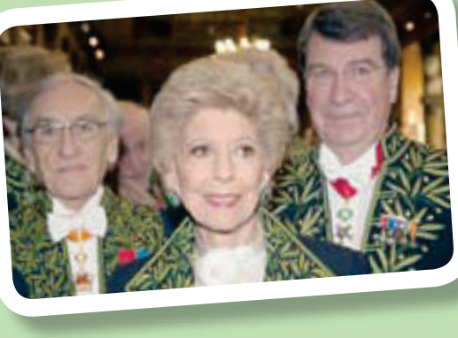
الأمينة العامة المؤرخة هيلين كارير دونكوس بالزي الرسمي للاكاديمية

قل للعريقة في المعالي أم العياقبي العوالي من كل لؤلؤة عمدت لها نظير في اللاي ما من حلالة حبة المانجو لساني اليوم حالي