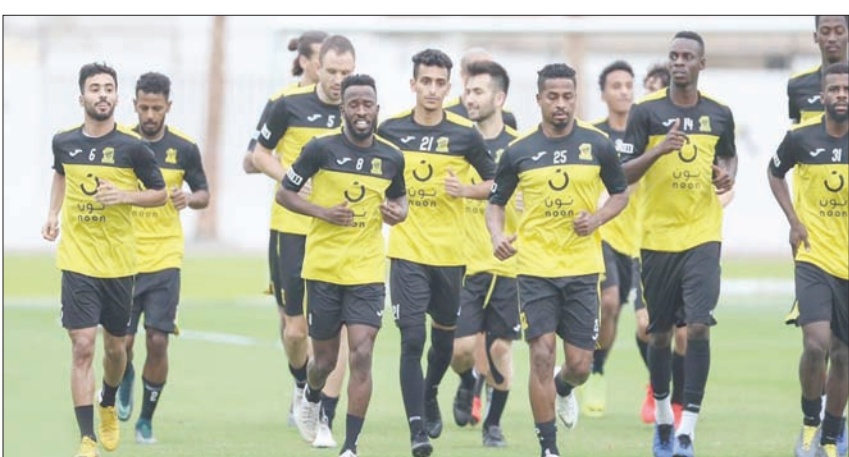
من تدريبات الاتحاد الأخيرة