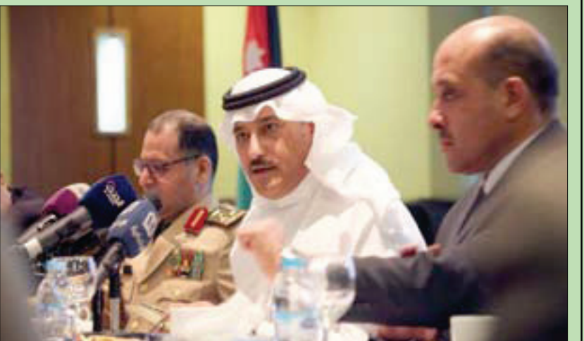
الأمير خالد بن فيصل سفير السعودية لدى الأردن خلال جلسة حوارية في عمان