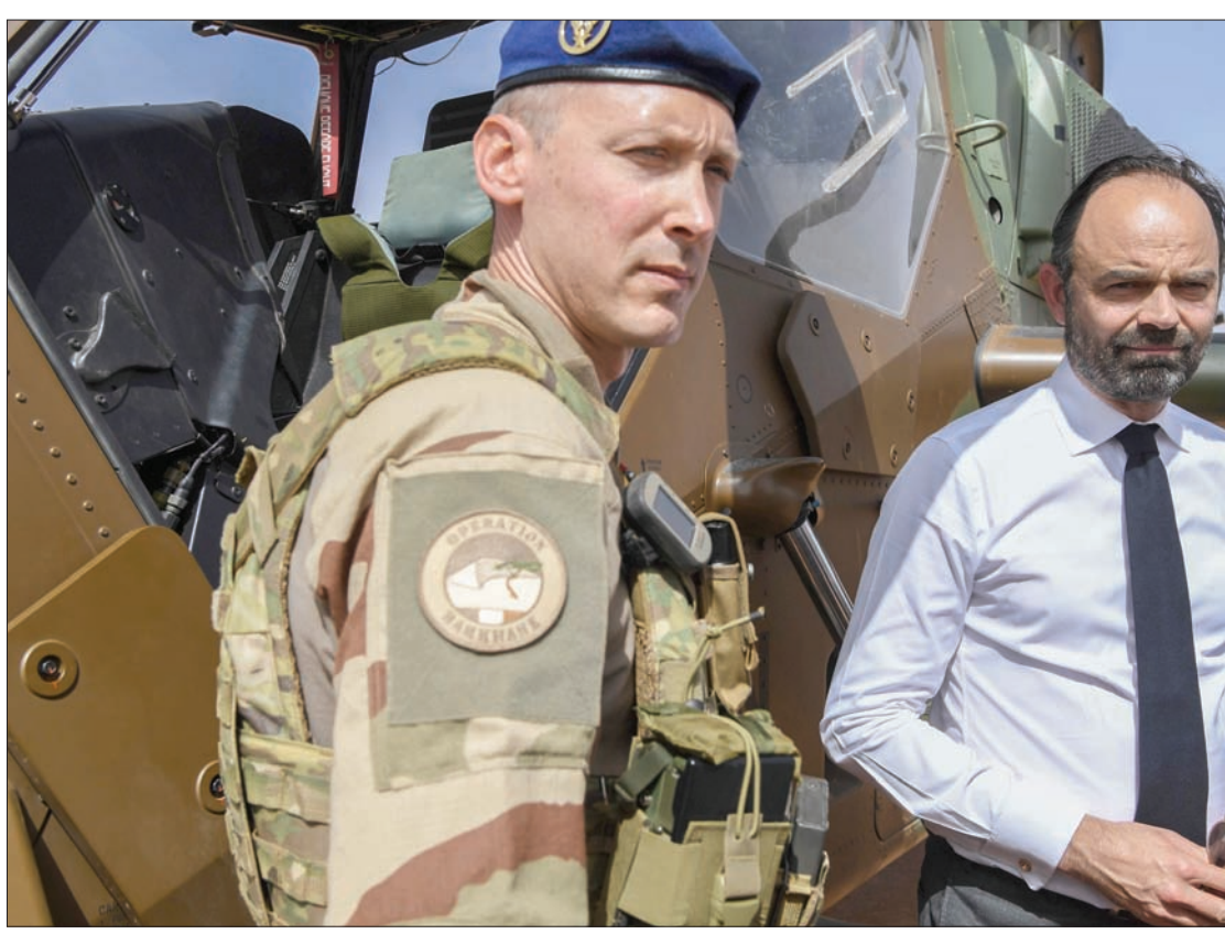
رئيس وزراء فرنسا إدوار فيليب خلال زيارته قوات بلاده الموجودة بمدينة غا شمال مالي الأحد الماضي

على شمال مالي عام 2012، ولكن الفرنسيين تدخلوا عسكرياً من خلال عملية «سيرفال» التي انطلقت مطلع عام 2013 لطرد الإرهابيين من كبريات مدن الشمال، وتحولت منتصف عام 2014 إلى عملية «برخان» التي توصف بأنها أكبر عملية عسكرية يشنها الفرنسيون خارج أراضيتهم، وتنشط في 5 دول هي: موريتانيا، ومالي، والنيجر، وبوركينا فاسو، وتشاد. مع جبهة أخرى، استطاعت