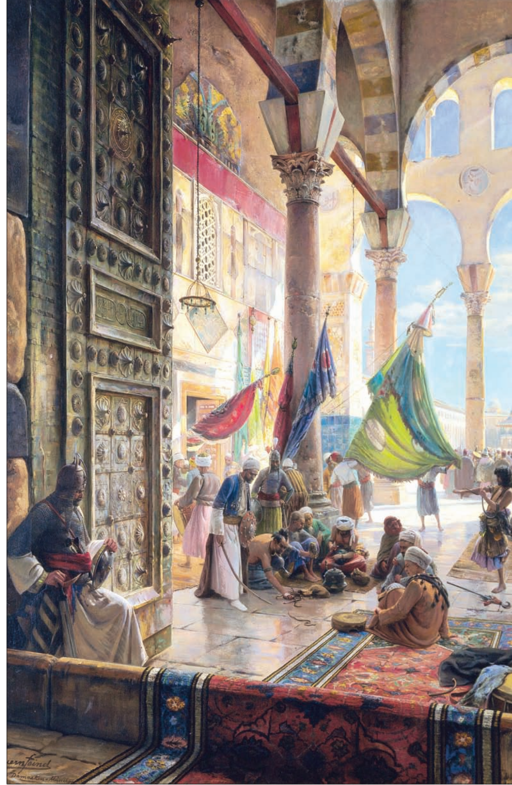
لوحة للفنان الألماني غوستاف بارونفايند بعنوان «الساحة الأمامية للمسجد الأموي 1890 بدمشق»

للقاعة في قصر الحمراء والتي تطل على ساحة نافورة الأسود الشهيرة. الجدير بالذكر أن اللوحات الثلاثة ستعرض في دبي في الفترة من 19 إلى 23 مارس (آذار) ثم تعود لتعرض في لندن مع بقية اللوحات في المزاد بمقر الدار بشارع كنف ستريت يوم 26 أبريل.