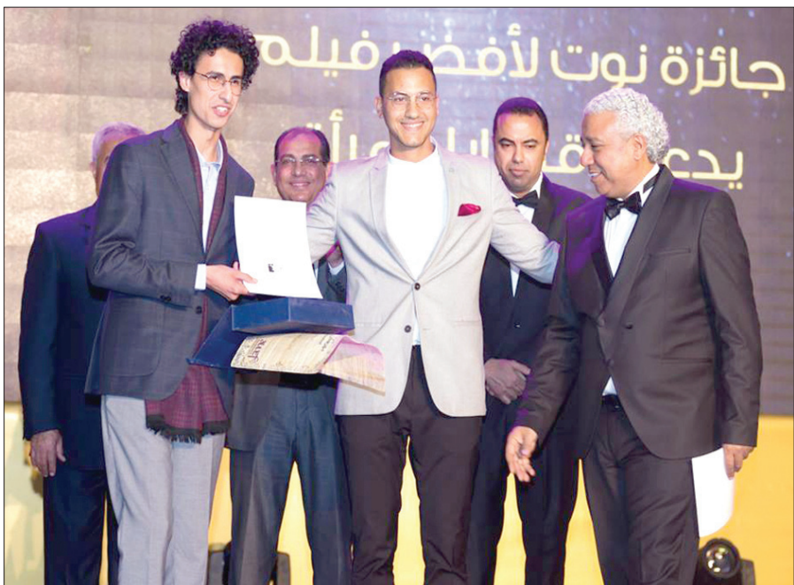
جانب من توزيع صناع الفيلم بمهرجان أسوان

إضفاء المصداقية المطلوبة». وأوضح طلبة أن «الختان ليس كل موضوع العمل، ولكنه جزء من ضمن الأحداث، حيث نتعرض للفيلم لكثير من المشكلات التي يواجهها سكان هذه القرية وغيرها من القرى الريفية، ومن أننا كمخرج أجدها مناسبة للغاية للموضوع، بحيث لو تم تطويله