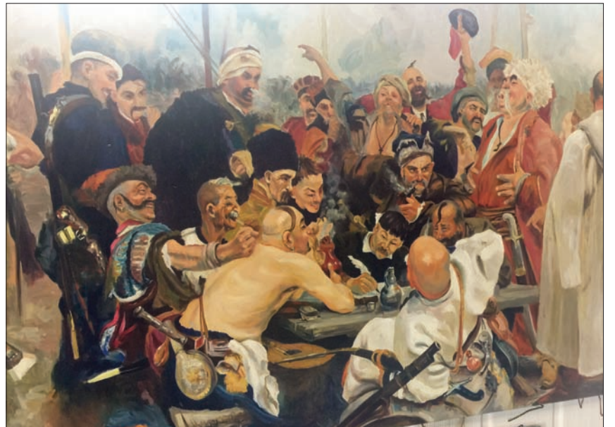
إحدى اللوحات المعروضة في المجمع الفني