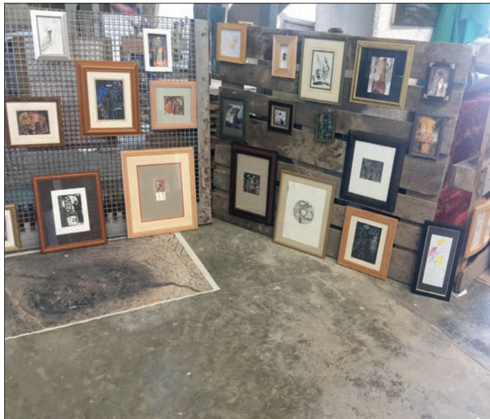
من داخل قاعات المجمع الفني وأروقته بعد تأهيله أخيراً