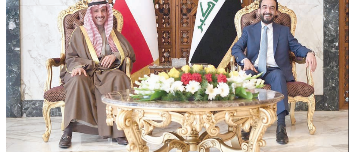
رئيس مجلس الأمة الكويتي مرزوق الغانم خلال لقائه في بغداد مع رئيس مجلس النواب العراقي محمد الحلبوسي

تعزيز العلاقات بين البلدين لما فيه مصلحة الشعبين الشقيقين». ونقل بيان مجلس النواب العراقي عن الحلبوسي قوله: «نقدر عالياً ووقوف الكويت مع العراق في حربه ضد