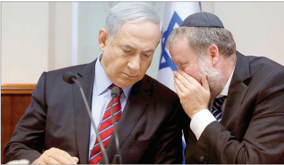
مندبليليت ونتنياهو في اجتماع الحكومة في 2014

تل أبيب، نظير مجلي على رغم خطورة الاتهامات، التي أعلنت النيابة الإسرائيلية، أمس، عزمتها توجيهها إلى رئيس الوزراء بنيامين نتنياهو، وتضمنت «خيانة الأمانة والاحتيال وتلقي الرشوة»، فإن تطورات القضية تشير إلى أن نتنياهو لن يدخل قفص الاتهام هذه السنة على الأرجح، وقد يعود رئيساً للوزراء بعد الانتخابات التي ستجري الشهر المقبل، ويصعب بذلك إجراءات المحاكمة. وأعلن المدعي العام أفيحا مندبليليت، أمس، أنه قرر توجيه لائحة اتهام بحق نتنياهو. وقال إنه أرسل محامي رئيس الوزراء قراره توجيه «تهم جنائية عدة ارتكبت خلال فترة توليه منصب رئيس الوزراء ومنصب وزير الاتصالات في الملفات المعروفة باسم الملف 1000 والملف 2000 والملف 4000»، وعبر عن رغبته في عقد جلسة استماع لنتنياهو لمنحه فرصة للدفاع عن نفسه قبل تقديم الاتهامات. واعتبر حزب «ليكود» الحاكم، في بيان، أن توجيه الاتهام «اضطهاد سياسي»، ووصف «النشر الأحادي لإعلان المدعي