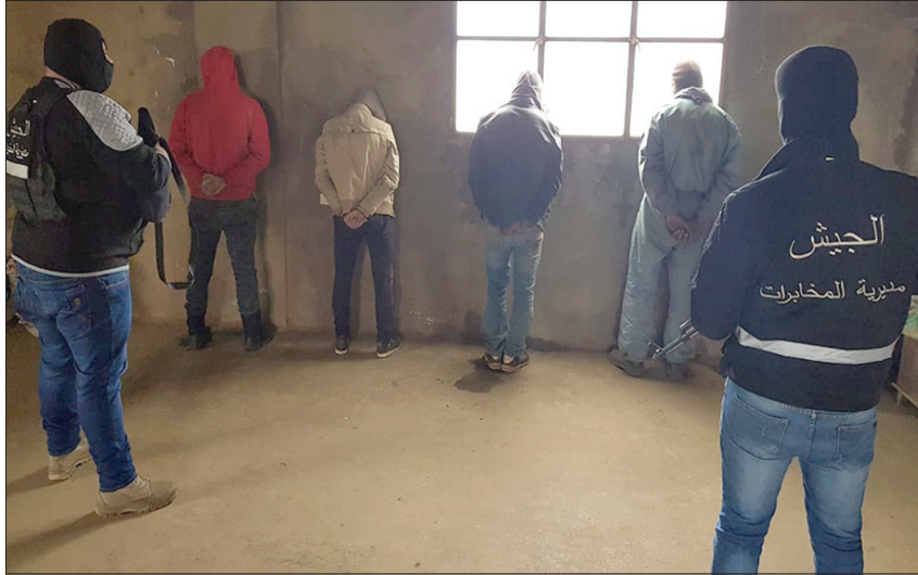
موقوفون في الحملة ضد تجار المخدرات