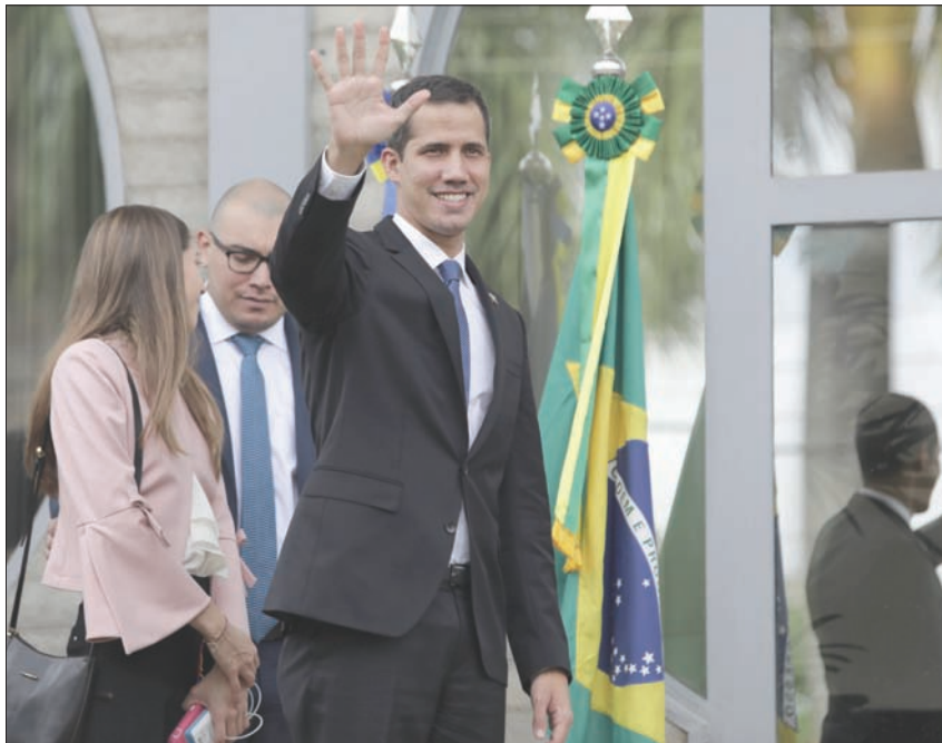
غوايدو لدى وصوله للقاء سفراء وممثلين أوروبيين في برازيليا أمس

على صعيد متصل، وصل غوايدو الذي تعترف به نحو خمسين دولة رئيساً بالوكالة، إلى البرازيل صباح أمس حسب وسائل الإعلام البرازيلية. اللقاء الرئيس جابر بولسونارو. وكان الناطق باسم الرئاسة