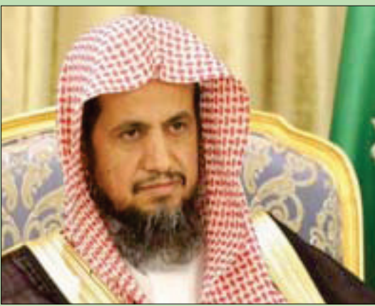
النائب العام السعودي سعود المعجب

عليها بكل تقان واقتدار». وأكد أن جهود النيابة العامة في مكافحة الفساد يعلمها الجميع، وتبوات بموجبها منزلة رفيعة في مصاف دول المجتمع الدولي المعني بهذا الجانب، مهيباً بالجميع الإخلاص في العمل والحرص على استكمال إجراءات التحقيق في مثل هذه القضايا بكل كفاءة وإتقان، لتحقيق تطلعات القيادة في محاربة هذه الآفة، وتبعتها إنشاء دوائر متخصصة في قضايا الفساد بالنزاهة العامة، تتولى التحقيق والادعاء في تلك القضايا، وترتبط بالنائب العام مباشرة، وهذا يدل على عزم ونقل المسؤولية التي أنيطت بالنزاهة العامة». ولفت إلى أن «مصاربة الفساد وقطع دابره هو جوهر العمل الذي أنيط بكم، وهي الإمامة التي أولانا إياها ولي الأمر، وحرص على قيامنا