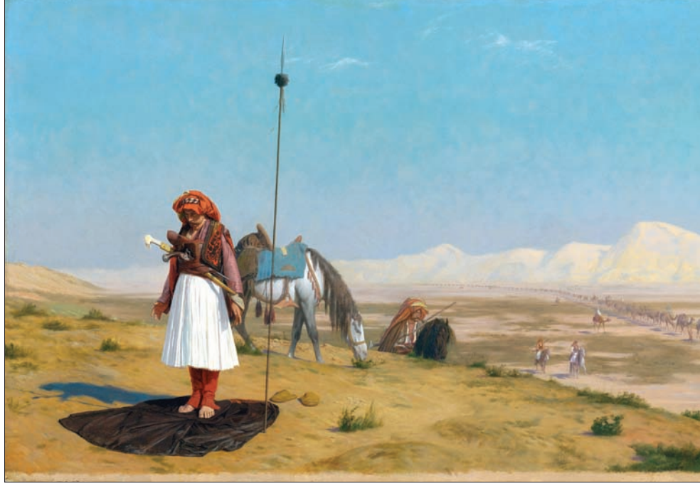
لوحة جان لوي جيرودم بعنوان «صلاة في الصحراء» (كريستيز)

أسئال عن فكرة أن اللوحات الاستشراقية قد لا تكون مرسومة من المكان ذاته وأن بعضها يجتج لعكس صورة نمطية عن حياة الشرق، يقول إن هذا الأمر قد يكون صحيحاً بالنسبة لبعض الفنانين ولكن بالنسبة لنجم المزاد القادم وهو الفنان الألماني غوستاف بارونفايند فهو عاش في الشرق لغترات متقطعة ويضيف: «حرص الفنان على كتابة وثائق حول مشاهداته في الشرق، عندما رسم اللوحة كتب في يوم