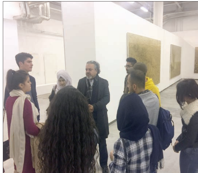
فنانون ومثقفون في السلبيانية يحولون معمل التبغ إلى مجمع فني