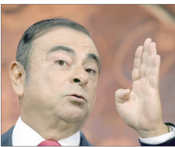
كارلوس غصن

الثاني): «لماذا اتهم معاقبتي قبل إرائتي؟» وأضاف أن رفض الديمقراطية أخرى».