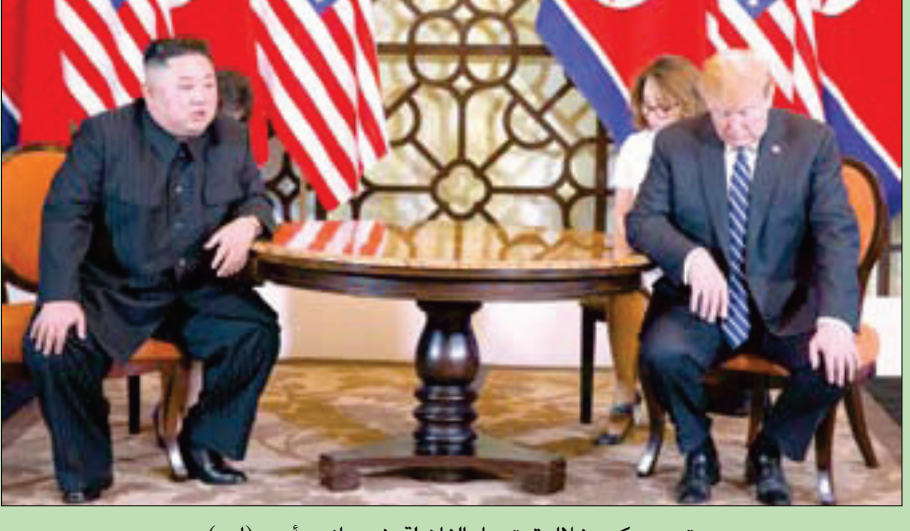
ترمب وكيم خلال قمتهما «الفاشلة» في هانوي أمس