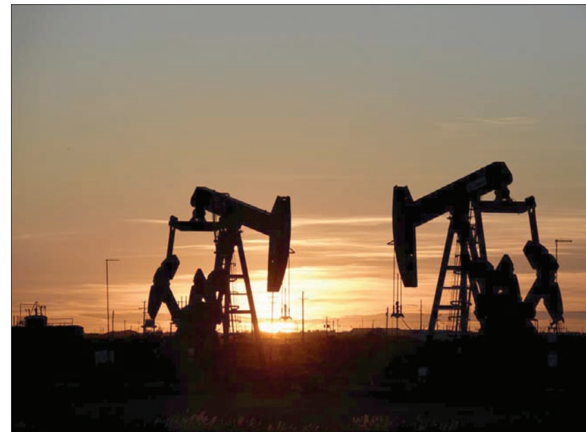
قللت العقود الأميركية التي دخلت حيز التنفيذ في نوفمبر الماضي صادرات إيران النفطية بشكل حاد

بلغ قروض بطاقات الائتمان نحو 15,3 مليار ريال (4 مليارات دولار) في الربع الرابع من العام الماضي 2018. بينما بلغت القروض العقارية من شركات التمويل العقاري نحو 16 مليار ريال (4,2 مليار دولار)، موزعة على فئات مختلفة من المنتجات المصرفية، مشيراً إلى أن «التقدم كان رائعاً، لكن يجب بالطبع أن نستمع إلى الجانب الصيني وإلى الرئيس شي جينبينج... واعتقد أننا نتجه نحو إبرام صفقة تاريخية هامة». وتأتي تعليقات كودلو