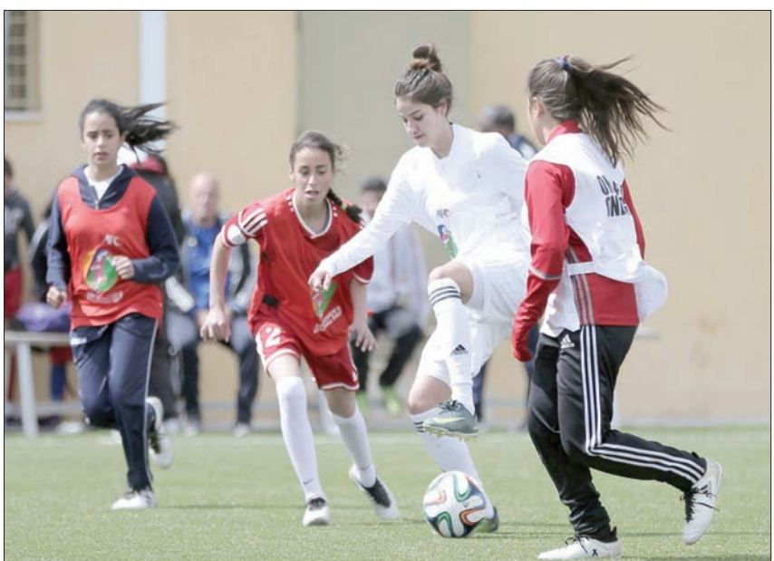
منافسات البطولة النسائية الخليجية ستطلق اليوم في الدمام (الشرق الأوسط)

العتيق التي شددت على أن هناك مبادرة ستكون كبيرة وسيتم الإعلان عنها هي الأولى في الوطن العربي. كما سيشهد حفل الافتتاح إقامة كثير من الفقرات الفنية، ومن أبرزها مشاركة 50 فتاة استعراضية يقدمن أغنية باللغتين العربية والإنجليزية مع فيديو كليب يوضح إنجازات المرأة السعودية على مر الأعوام السابقة، وتمكين المرأة، في 35 دقيقة. وعقب الانتهاء من فعاليات الحفل الافتتاحي ستطلق مباريات فعالية كرة القدم بإقامة مواجهتين المباراة الأولى فريق شعلة الشرقية بنظيره فريق اليمامة، فيما ستكون المواجهة الثانية بين فريقين رويال والتحدي. وقد أكملت اللجنة العليا