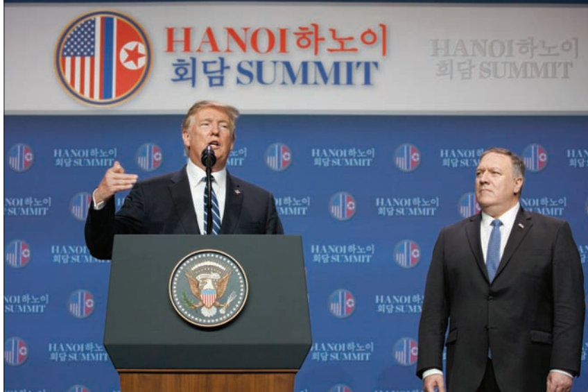
ترمب يعقد مؤتمراً صحافياً بحضور بومبيو في هانوي أمس (أ.ب)

وأضفى ترمب أكثر من 20 ساعة بالطائرة للوصول إلى هانوي. من جهته قام الزعيم الكوري الشمالي برحلة في القطار استغرقت يومين ونصف اليوم، وعبر الصين لحضور هذا اللقاء الثاني. ومن المقرر أن يبقي كيم في هانوي لزيارة رسمية قبل أن يغادرها غدا السبت. وإذا كان كيم جونج أون تحدث في هانوي عن احتمال فتح مكتب تمثيلي دائم