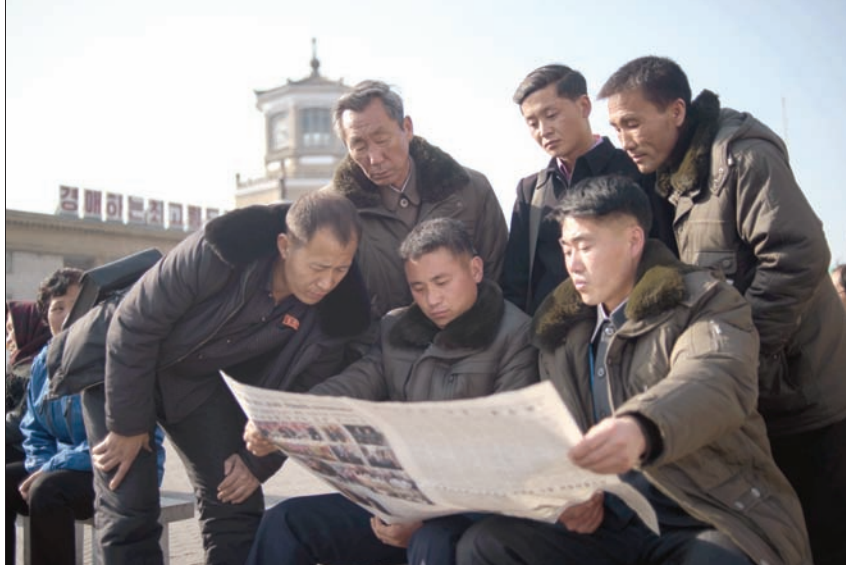
كوريون شماليون يقرأون أخبار القمة المنشورة في صحيفة «رودونغ سينغون» في بيونغ يانغ أمس

قالت أوساط وزارة الدفاع إن الرئيس ترمب كان سيقدّم مقابل هذا التعهد، واستعداد الولايات المتحدة للتوقيع على اتفاق مع كوريا الشمالية إن كانت تستخدمها الصين في صراعها السياسي والاقتصادي مع مواجهة دول المنطقة والولايات المتحدة يُعتقد أن مفعولها انتهى، بعد التغييرات الجيوبوليسية والاقتصادية التي شهدتها منطقة شرق آسيا في العقد الأخير.