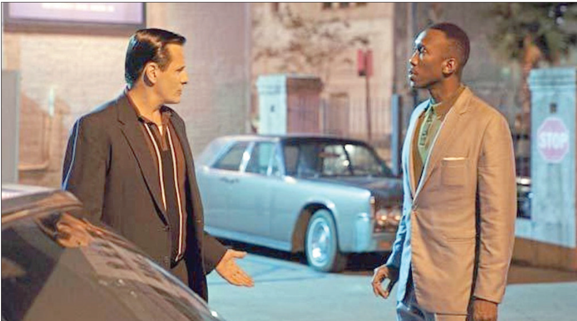
من فيلم «كتاب أخضر»