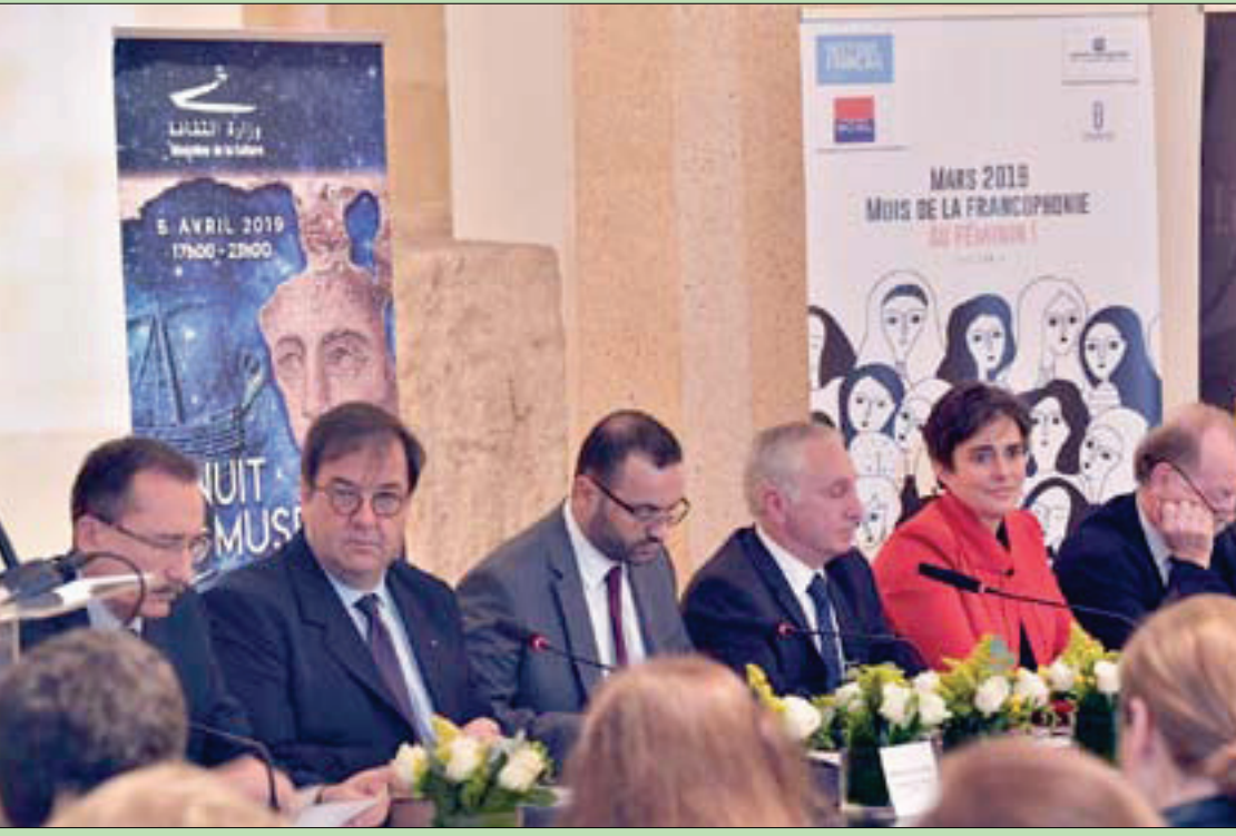
وزير الثقافة محمد داود وعدد من السفراء الأجانب في المؤتمر الصحافي لإطلاق «شهر الفرنكوفونية» في لبنان

يشهدها شهر الفرنكوفونية في لبنان، أمسية موسيقية مع عازفين سويسريين (مارك أيمون وأرقام سالزمان) بعنوان «الصفير الجميل أغان لا تموت». فيكتشف معها الحضور 14 أغنية من الفولكلور السويسري يتضمنها اليوم كامل رسم صورة السويسري المعروف كوزاي فيبحرون معه في رحلة فرنكوفونية عريقة وذلك في 5 مارس في المركز الثقافي الفرنسي في بلدة دير القمر الشوفية. ومن بلجيكاً ستتاح لعدد من الزوار تخترامهم سفاراتهم في لبنان بزبارة «متحف الشوكولا» في منطقة فردان، ليتعرفوا إلى أهم