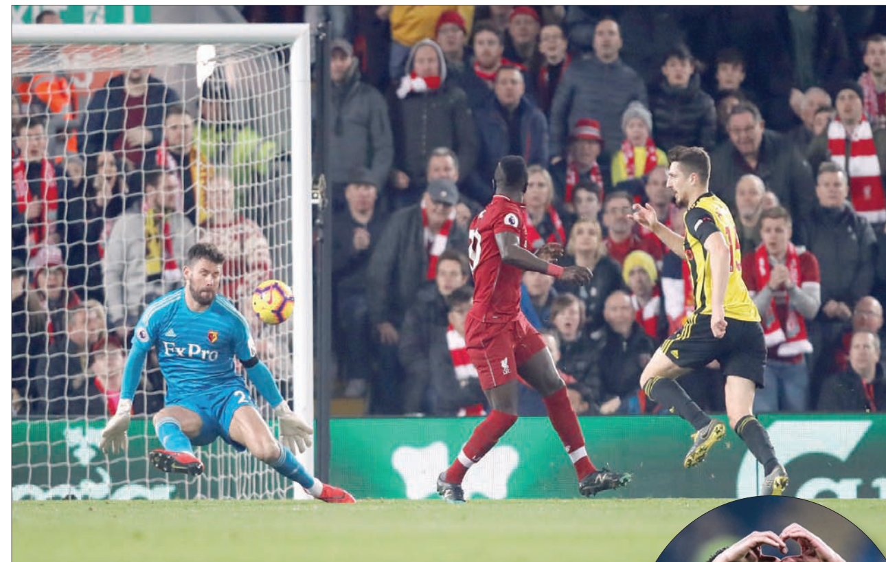
ماني (في الوسط) يسجل كجذب قدمة أجمل لأهداف ليفربول من الخماسية في مرمى واتفورد

وعلى ملعب الإمارات سحق أرسنال ضيفه بورنموث 5 - 1 في أول مشاركة للألماني مسعود أوزيل في التشكيلة الأساسية منذ التعادل 1 - 1 مع برايتون أند هوف البيون. ونجح أوزيل في افتتاح التسجيل كما صنع هدفا آخر في انتصار فريقه الذي ضمن لأرسنال البقاء في المركز الرابع. وأضاف كل من الأرميني هنريك مختاريان والفرنسي لوران كوسيليني والغابوني بيار إيميريك