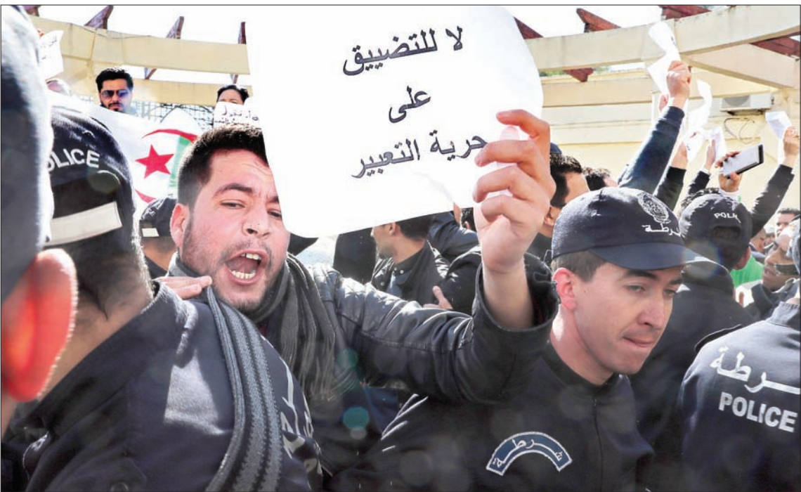
جانب من المواجهات التي جرت بين صحافيين وقوات الأمن وسط العاصمة الجزائرية أمس

استعدادات فريق حملته لزيارة عين وسارة (300 كلم جنوب العاصمة)، كانت مقررّة اليوم في إطار الدعاية الانتخابية، لكنها ألغيت بعد تداول «الفضيحة». وفي المكالمة قال سلال لحداد إنه لو صادف في طريقه بعض المتظاهرين «أطلقوا علينا النار بكلاشنكوف، فسنطلق النار نحن أيضاً. أين المشكلة».