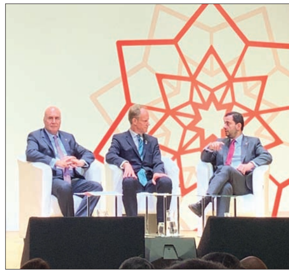
جانب من جلسة حوارية جمعت وزير التجارة والصناعة الأردني طارق الحموري ووزير الاستثمار الأردني مهند شحادة ضمن مؤتمر أمس

المؤتمر يمثل مرحلة انطلاق مهمة في مسيرة الإصلاح الاقتصادي في البلاد، التي تم الاتفاق عليها مع البنك الدولي. وأضاف الحموري في تصريح لـ«الشرق الأوسط» أن «الزمن هو التحدي الأكبر الذي يواجه الأردن اليوم». وأوضح أن «هناك عملاً حقيقياً على الأرض في الملف الاقتصادي والملف المالي وملف خلق فرص العمل وزيادة الاستثمارات، لكننا نحتاج إلى زمن للوصول إلى الهدف المرجو، لذا، أكبر تحدٍ هو اختصار الزمن».