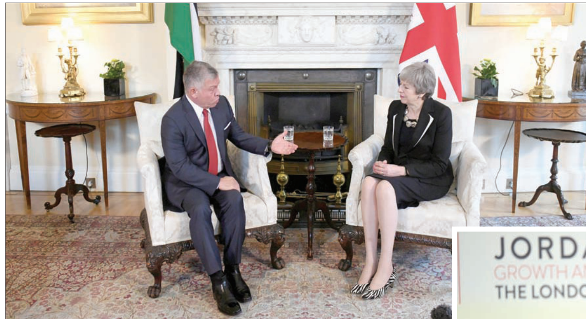
العاهل الأردني الملك عبد الله الثاني مع رئيسة الوزراء البريطانية تيريزا ماي في لندن أمس

تؤكد أن العودة يجب أن تكون إلى سوريا آمنة. ولكن نتفهم أن الدول المستقبلية للاجئين من حقها التساؤل عن تخيل زمني لإعادة اللاجئين». وقال رئيس الوزراء الأردني عمر الرزاز، إن سياسة الباب المفتوح في استقبال اللاجئين كلفت الأردن سنوياً 2,5 مليار دولار، وإن الحكومة أطلقت خطة عملها لتحسين الوضع الاقتصادي في البلاد، التي تعتمد على 3 مسارات، سيادة القانون، وتوفير فرص العمل، وتحقيق النمو الاقتصادي.