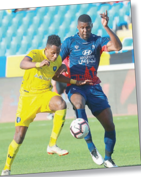
التعاون حقق فوزاً كبيراً على الاتفاق أمس

وفي ختام مواجهات هذا المساء، يبحث الرائد صاحب الأرض والجمهور عن وقف الخسائر المتتالية، التي ذهبت به للمركز العاشر على سلم الترتيب 24 نقطة، فيما يسعى القادسية للعودة لطريق الانتصارات وإيقاف نزيف النقاط الذي كلفهم 4 خسائر ما بين المباريات الخمس الأخيرة، حيث يملك الضيوف 23 نقطة في المركز الـ11.