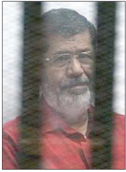
مرسي في جلسة سابقة لنظر قضية الحدود الشرقية

وتهددهم نحو 20 ألف مسجون من السجن الثلاث المذكورة، فضلاً عن اختطاف 3 من الضباط وأمين شرطة من المكلفين بحماية الحدود، واقتيادهم عنوة إلى قطاع غزة».