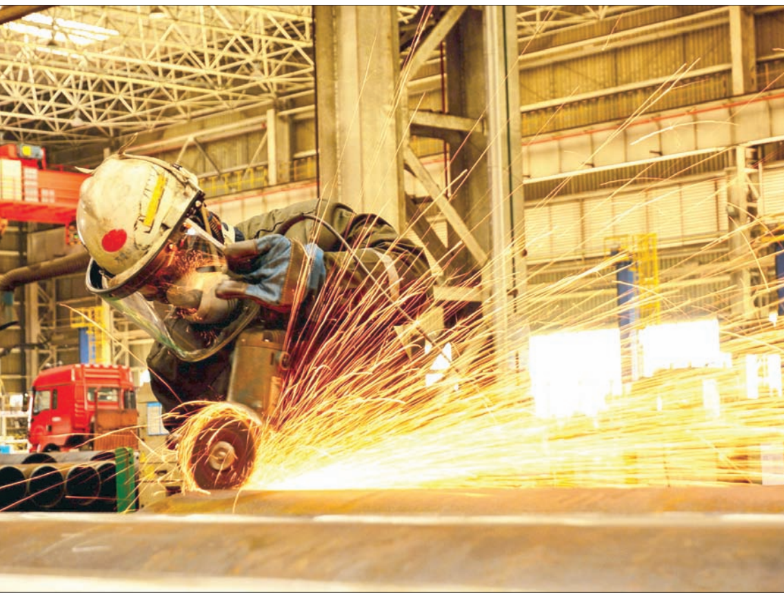
مخاوف من أن تواجه الصين تباطؤاً أكثر حدة إذا لم تسهم محادثات التجارة مع الولايات المتحدة في تخفيف الضغوط

يعود بالأساس إلى ارتفاع تكلفة الرعاية الصحية والمعيشة، في حين انخفض الإنفاق على الغذاء والملابس. وجاء ذلك بالمقارنة مع زيادة بلغت 5,4 في المائة في 2017. وشكلت تكاليف الرعاية الصحية 8,5 في المائة من إجمالي الإنفاق العام الماضي، ارتفاعاً من 7,9 في المائة في 2017، بينما شكلت تكاليف المعيشة 23,4 في المائة (الدولار = 6,6827 يوان). وفي أول رد فعل بعد نشر تلك البيانات، تراجعت الأسهم الأوروبية للجلسة الثانية أمس، مع تأثر شركات التعدين بفعل بيانات مخيبة للأمل عن القطاع الصناعي في الصين أكبر مستهلك للمعادن في العالم ومع تنامي حذر المستثمرين بشأن اتفاق تجارة محتمل بين واشنطن وبكين. ويحلل الساعات 08:32 بتوقيت غرينتش، هبط المؤشر ستوكس 600 الأوروبي 0,4 في المائة لينزل أكثر عن ذروة أربعة أشهر التي سجلها في وقت سابق من الأسبوع. وانخفض المؤشر داكس الحساس للتجارة 0,4 في المائة وفق فابيان شبال تايمز 100 الغني بشركات السلع الأولية 0,7 في المائة. وتصدر التعدين خسائر القطاعات، حيث انخفض مؤشره 1,8 في المائة مع هبوط أسعار النحاس بعد أن انكماش نشاط المصانع في الصين للشهر الثالث على التوالي في فبراير. وتراجعت أسهم ريو تينتو 1,8 في المائة وبني إتش بي 2,2 في المائة. وانتسع نطاق الخسائر مع تردد المستثمرين في المخاطرة بعد أن قال الممثل التجاري الأميركي روبرت لايتهايزر إن من السابق لأوانه التكهن بنتيجة مفاوضات التجارة بين أكبر اقتصادين في العالم.