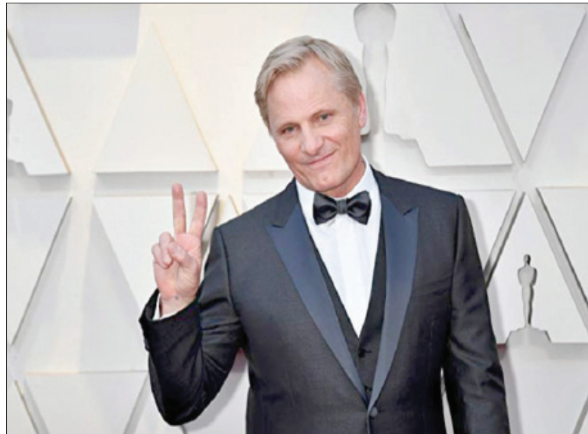
فيغو مورتسن على منصة الأوسكار