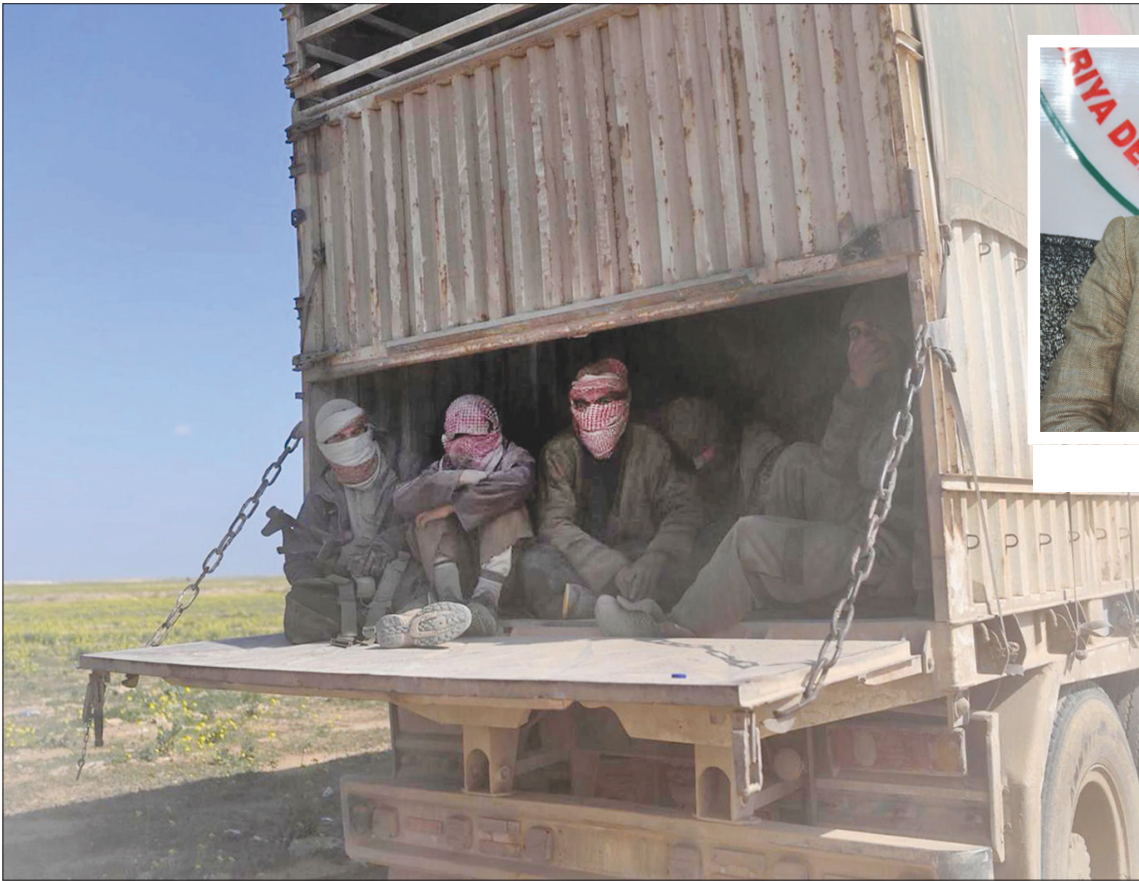
مسلمون يغادرون مع عائلاتهم آخر جيوب «داعش» شرق الفرات

كان الرئيس الأميركي دونالد ترمب، قد دعا دولاً أوروبية بينها ألمانيا وفرنسا، عبر موقع «تويتر»،