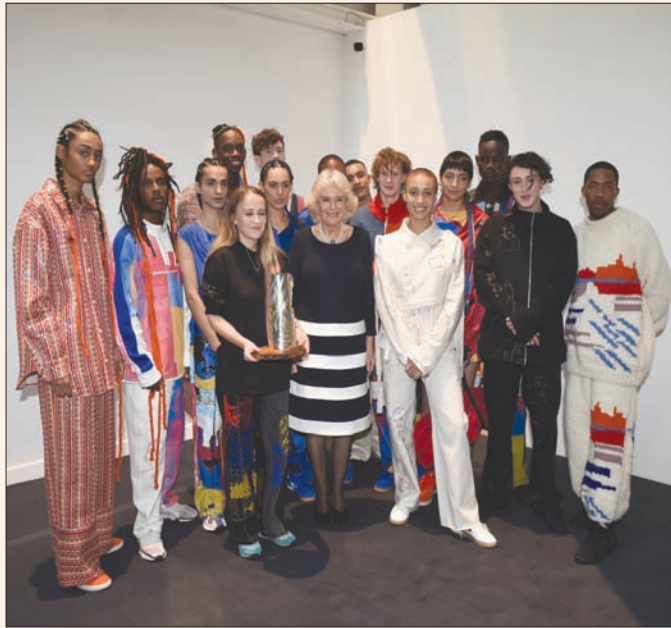
دوقة كورنويل، كاميليا باركر بولز مع المصممة بيثاني ويليامز وتشكيلتها

فرص عمل تساعدن على الحياة. وبالعمل شاركت فئاتان منهن في عرض المصممة الشابة، التي وعدت أيضاً بان شخص 20 في المائة من أرباح تشكيلتها لصالح ماوى خاص بالنساء الناجيات من العنف المنزلي أو خريجات السجن.