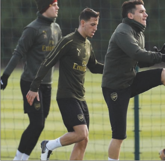
لاعبو أرسنال خلال التدريبات استعداداً لمواجهة باتي اليوم

وتمثل بطولة الدوري الأوروبي الفرصة الأخيرة لأرسنال من أجل الخروج باي لقب في الموسم الحالي علماً بأنه الأول للفريق بقيادة مديره الفني الإسباني أنواي إيمري الذي تولى قيادة الفريق خلفاً للمدرب الفرنسي أرسين فينغر الذي رحل عن مقعد المدير الفني الذي شغله لأكثر من عقدين. ومن المؤكد أن أي نتيجة بخلاف الفوز الكبير على الفريق الجيلاروسي ستعجز إيمري في مواجهة صعبة مع جماهير النادي التي تمنى نفسها بلقب البطولة الذي أحرزه المدرب الإسباني ثلاث مرات سابقة متتالية مع أنشيليه الإسباني. وقال إيمري: «أشقى في استعداداتنا للمباراة، وأثق أننا سنحقق نتيجة مختلفة على استاد الإمارات».