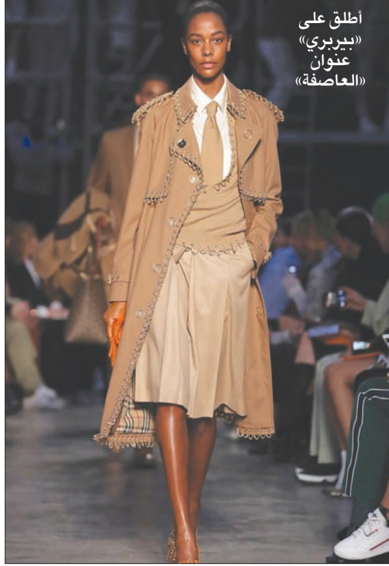
اطلق على «بيربري» عنوان «العاصفة»

اسم الدار بالبنط العريض حتى لا تضع هويته. أمر تكرر في قطع أخرى مثل الجاكيتات الرجالية والأوشحة وباقي الإكسسوارات. ما نجح فيه ريكاردو تيشي منذ التحاقه بـ «بيربري» أنه التقط روح الدار واستطاع أن يُبرز شخصيتها بشكل بروف للجميع. فكل قطعة، بما فيها تلك التي فاحت منها رائحة بروجازية، قد يراها البعض باريسية والبعض الأخر ميلانية، كانت مترسخة في الجذور البريطانية أو مأخوذة من أرشيف الدار. ما قام به أنه زادها انوثة وصب عليها جرعة «تجارية» والمقصود من التجاري هنا