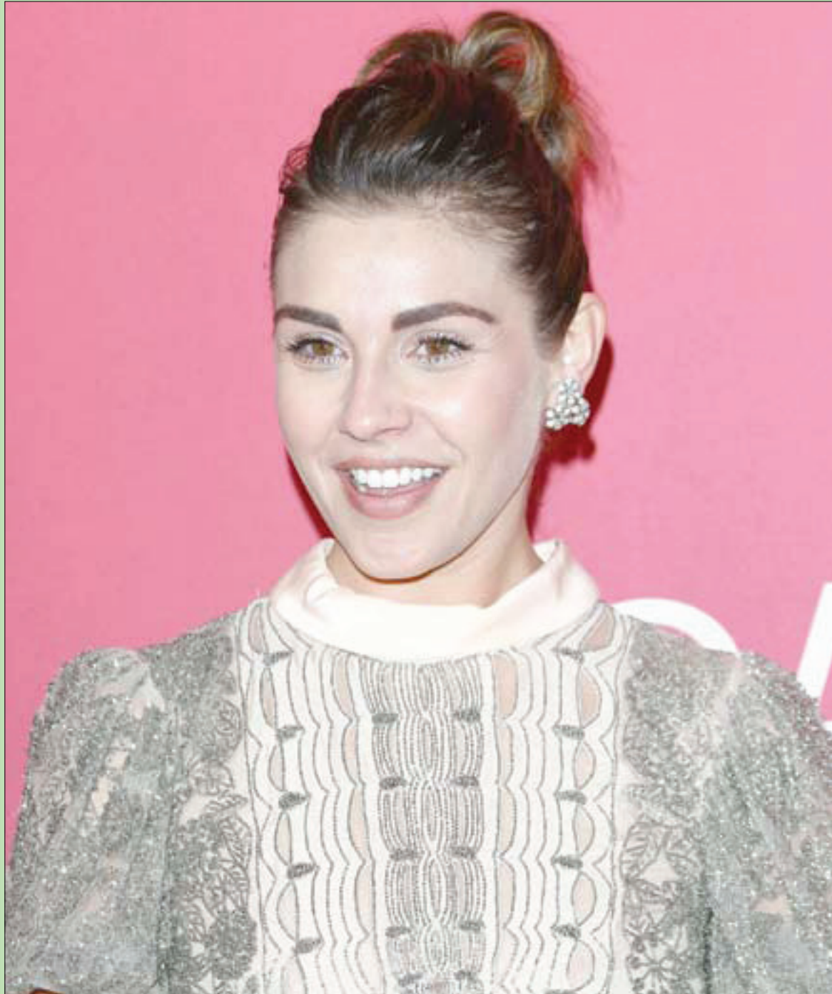
المثلة الأميركية ليلي ميرونيك تصل إلى حفل توزيع جوائز مصممي الأزياء (إي جي دي سي) في بيفرلي هيلز بكاليفورنيا

وما أبعد الفرق بين عصره وحادثة آخر حصل في العصر الحديث، وذلك عندما اشكت أحد الأندية الرياضية المغلقة من السرقات، فوضعت شرطة (دونكاستر) كاميرا بين خرائن الثياب لتفحص السارق. وعندما استعرضوا الفيلم، لاحظوا أن الشيء الوحيد الذي تمكنوا من تصويره هو زميل لهم يهيم في كل اتجاه (ربي كما خلقتني) يبحث عن ملابسه المسروقة؛ إذ أن نفسه قد هفته ليدخل (السوا) لمدة عشر دقائق، وخلع ملبسه وعلقها مع المنشقة، ودخل لكي يستمتع، وعندما خرج لم يجد لا ملبسه ولا حتى المنشقة، فقد طارت الطيور بأرزاقتها.