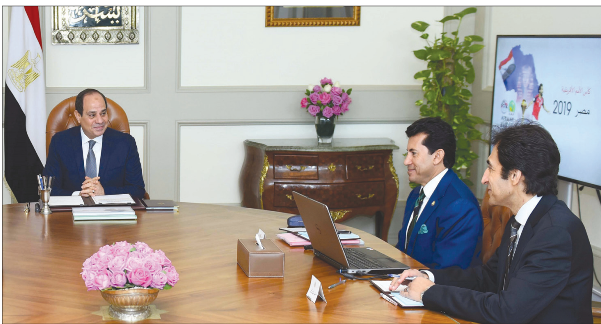
الرئيس المصري عبد الفتاح السيسي خلال لقائه وزير الشباب والرياضة أشرف صبحي (الثاني من اليمين). وتعد السيسي بتقديم كل الدعم للاتحاد الأفريقي لكرة القدم من أجل نجاح «كأس الأمم» التي تستضيفها مصر اعتباراً من 21 يونيو (حزيران) المقبل. وقال بسام راضي المتحدث باسم رئاسة الجمهورية في بيان إن الرئيس أكد حرص الدولة على توفير جميع المتطلبات على كافة المستويات التنظيمية والإدارية واللوجيستية، لإنجاح كأس أفريقيا.