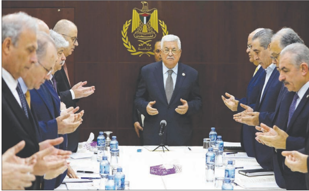
الرئيس الفلسطيني محمود عباس في افتتاح اجتماع للقيادة الفلسطينية في رام الله أمس

وقال عباس إنه لن يقبل أن تقرر إسرائيل اقتطاع ما نشاء من الأموال الفلسطينية، مطالباً من العالم بحمل مسؤولياته، وتضمن عباس موقف الاتحاد الأوروبي، الذي طالب إسرائيل بضرورة احترام الاتفاقات الموقعة، معتبراً ذلك وقوفاً إلى جانب الحق.