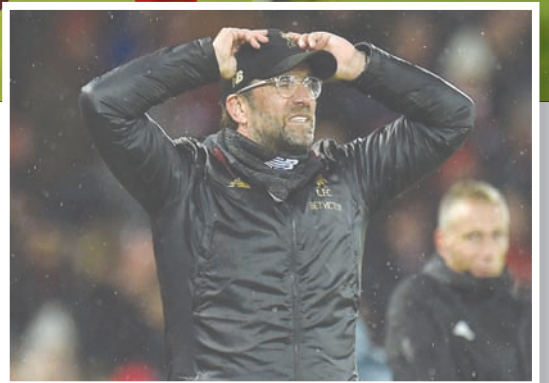
كلوب محبب لعدم فوز ليفربول

على ما يرام، فقد صنعنا الفرص، ولكن في الشوط الثاني لم يصنع أحد المزيد من الفرص». ويشعر أندي روبرتسون ربما ليفربول بأن التعادل السلبى ربما يكون حاسماً لفرقة في التأهل إلى دور الثمانية إذا أفلح في تسجيل هدف في الإياب. وقال الظهير الأيسر للفرق: «بكل تأكيد يشعر البايرن بسعادة أكبر بسبب الخروج بشباك نظيفة لكن خروج الفريق بشباك نظيفة على أرضه مهم جداً، أعرف أنه عندما نذهب إلى هناك سيكون للهدف قيمة كبيرة وإذا سجلنا هدفاً سيكون على المنافس تسجيل هدفين على الأقل». وأضاف: «إذا