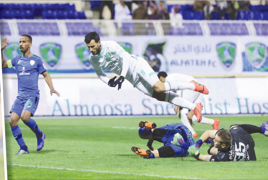
السومة لاعب الأهلي يتعرض للحرقلة من حارس الفتح

ويحتل الاتحاد، صاحب الصيفة، في رصيده النقطة 15 نقطة في المركز الـ 14، وبات مصير بقائه بين الأندية الكبيرة في