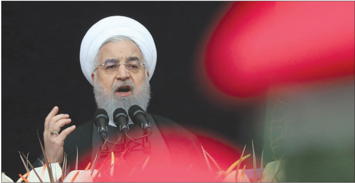
الرئيس الإيراني حسن روحاني

المحاولات الأميركية للحوار حول «برنامج الصواريخ بعدما تمكنت من اختراق برنامج الصواريخ».