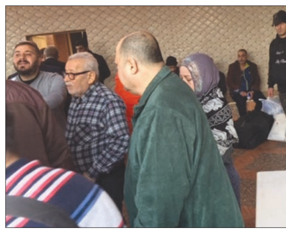
نزلاء مستشفى الفنار لدى جمعهم لنقلهم إلى مستشفيات أخرى

وتحدثت المصادر عن «مؤشرات أولية توحى بأن هناك توجهاً لتصوير أي إنجاز للوزير الجديد على أنه تقصير من قبل الوزير السابق، ما يطرح أكثر من علامة استفهام حول وجود نية لممارسة سياسة تشف بدل الانكباب على استكمال تنفيذ الخطط التي تم وضعها في الحكومات السابقة»، مستغربة «اتخاذ