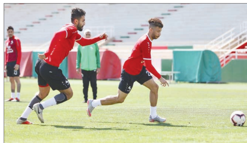
من استعدادات الاتفاق الأخيرة تأهباً للحزم (الشرق الأوسط)

أن الأمل كبير لتصحیح المسار. بقيت الإشارة إلى أن مباراة الاتفاق ضد الحزم ستكون الثانية التي يخوضها الفريق المستضيف على ملعبه الرئيسي بعد الموافقة على خوضه المباريات غير الجماهيرية على ملعبه.