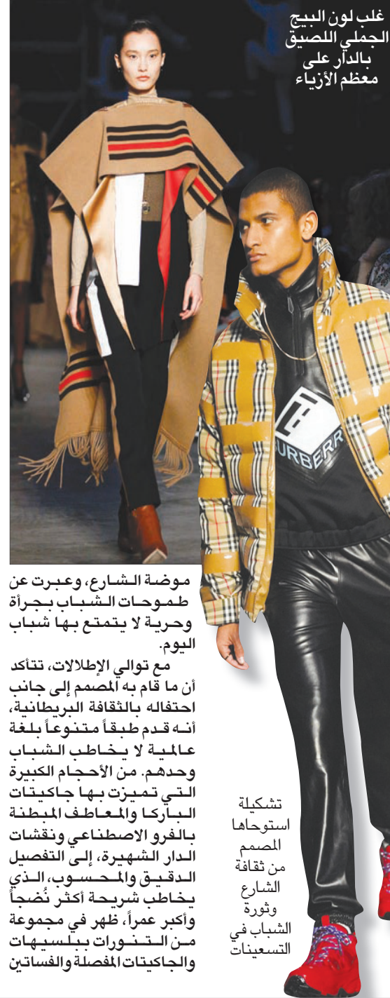
غلب لون البيج الجملي اللصيق بالدار على معظم الأزياء

المسدلة بالون البيج الجملي، كانت في غاية الأنافة تستحضر طموحات الشباب بجرأة وحرية لا يتمتع بها شباب اليوم. مع توالي الإطلاقات، تتأكد أن ما قام به المصمم إلى جانب احتفاله بالثقافة البريطانية، أنه قدم طبقاً متنوعاً بلغة عالمية لا يخاطب الشباب وحدهم. من الأحجام الكبيرة التي تميزت بها جاكيتات الباركا والمعاطف المبطنه بالفرو الاصطناعي ونقشات الدار الشهيرة، إلى التفصيل الدقيق والمحبس، الذي يخاطب شريحة أكثر نضجا وأكبر عمراً، ظهر في مجموعة من التشنورات بلبسيهات والجاكيتات المفصلة والفساتين