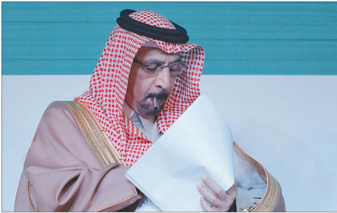
وزير الطاقة السعودي خالد الفالح في إحدى جلسات المنتدى السعودي الهندي بنيودلهي أمس

ضمن جهود لتقليص المعروض في الأسواق. لكن في مقابل خفض الإمدادات والعقوبات الأميركية، ارتفع إنتاج الولايات المتحدة من الخام أكثر من مليوني برميل يوميا في 2018 ليصل مستوى قياسي عند 11,9 مليون برميل يوميا. وقالت إدارة معلومات الطاقة الأميركية في تقرير شهري يوم الثلاثاء، إن إنتاج الولايات المتحدة من سبعة تكوينات صخرية كبيرة من المتوقع أن يرتفع بمقدار 84 ألف برميل يوميا في مارس إلى مستوى قياسي يبلغ نحو 8,4 مليون برميل يوميا. في الوقت ذاته، من المتوقع أن يزيد إنتاج الولايات المتحدة من الغاز الطبيعي إلى مستوى قياسي عند 77,9 مليار قدم مكعب يوميا في مارس. وسيتمثل هذا زيادة بأكثر من 0,8 مليار قدم مكعب يوميا مقارنة مع توقعات فبراير (شباط). فضلا عن كونه يمثل زيادة شهرية للشهر الرابع عشر على التوالي. وكان إنتاج الغاز عند نحو 65,5 مليار قدم مكعب يوميا في مارس من العام الماضي.