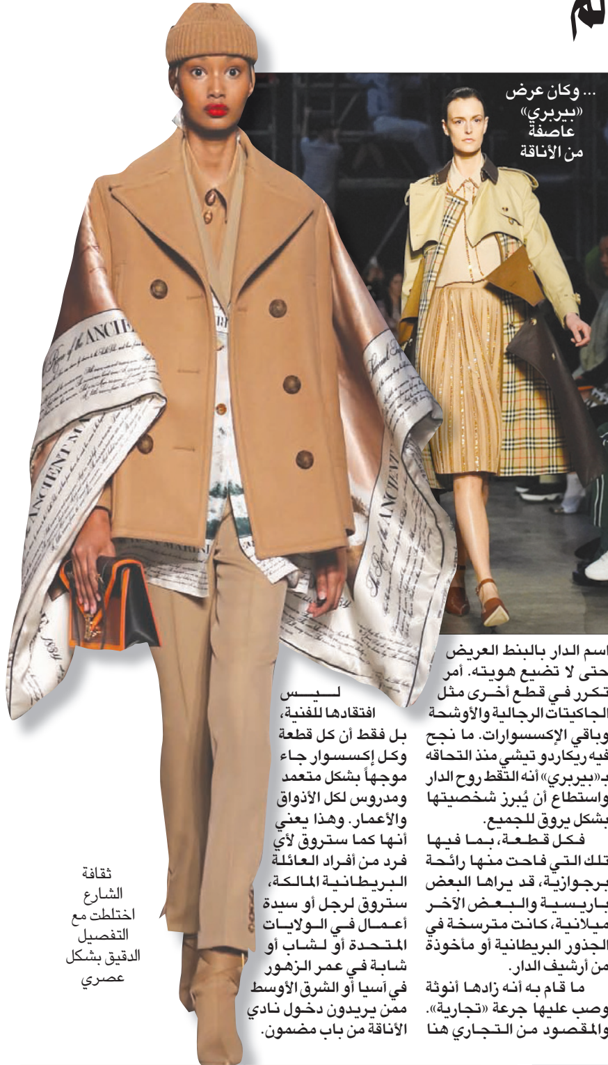
... وكان عرض «بيربري» عاصفة من الأنافة

اسم الدار بالبنط العريض حتى لا تضع هويته. أمر تكرر في قطع أخرى مثل الجاكيتات الرجالية والأوشحة وباقي الإكسسوارات. ما نجح فيه ريكاردو تيشي منذ التحاقه بـ «بيربري» أنه التقط روح الدار واستطاع أن يُبرز شخصيتها بشكل بروف للجميع. فكل قطعة، بما فيها تلك التي فاحت منها رائحة بروجازية، قد يراها البعض باريسية والبعض الأخر ميلانية، كانت مترسخة في الجذور البريطانية أو مأخوذة من أرشيف الدار. ما قام به أنه زادها انوثة وصب عليها جرعة «تجارية» والمقصود من التجاري هنا