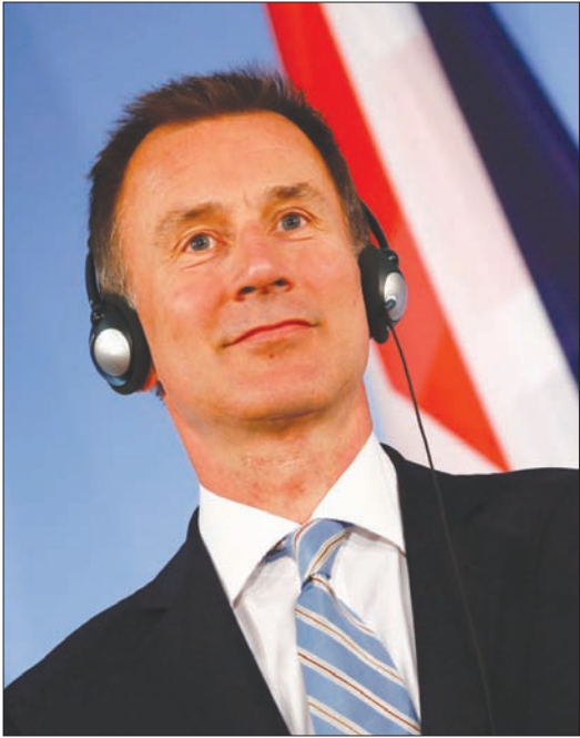
وزير الخارجية البريطاني جيريمي هانت (رويترز)

الرياض، عبد الهادي حيتور لندن، «الشرق الأوسط» دافع وزير الخارجية البريطاني جيريمي هانت أمس، عن علاقات بلاده الوثيقة مع السعودية، مؤكداً أن بلاده تربطها شراكة استراتيجية مع السعودية، قائلاً إنها تمنح بريطانيا مجالاً لمحاولة إنهاء الحرب في اليمن، ومشيراً إلى أنه «من دون هذه الشراكة الاستراتيجية، لما كنا تمكنا من المضي قدماً في اتفاق استوكهولم» حول وقف النار في اليمن.