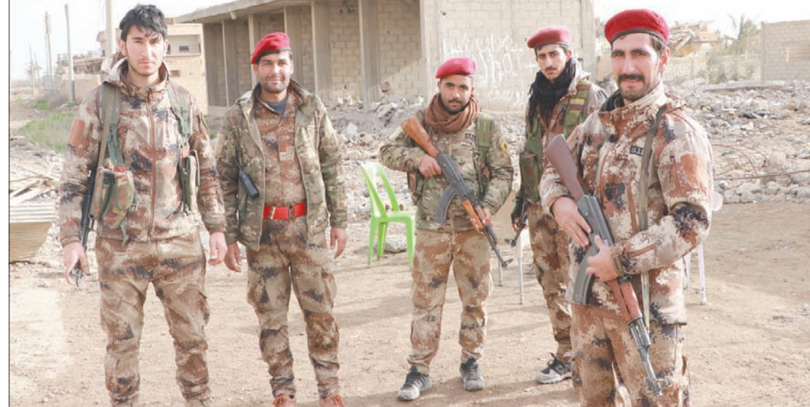
مقاتلون من «قوات سوريا الديمقراطية» على أطراف الباغوز شرق الفرات

توقفت خلال الأيام القليلة الماضية. وياتي الباغوز خالية من سكانها، حيث كان يسكنها قبل بدء المعركة بشهر ديسمبر (أيلول) العام الماضي، أكثر من 50 ألفاً بحسب شهادات مدنيين فروا منها خلال الأيام الماضية. وفي الإحساء الواقعة في أطراف البلدة أنهار سقفت كثير من المنازل أو خلعت أبوابها والشبابيك من شدة الانفجارات، أما المناجر والمحال التجارية فقد تعرضت للدمار والبعض منها سوي بالأرض، ولم يتبق منها سوى الأطلال. لكن المشهد يبدو صامداً أكثر في مركز البلدة، وتحديداً في ساحتها حيث جرت معركة مستحدمة جداً للسيطرة على