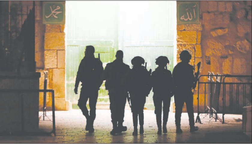
حرس إسرائيلي أمام مدخل المسجد الأقصى أمس بعد اضطرابات بسبب منع المصلين من دخوله

جهد مستوطنون اقتحاماتهم الاستفزازية للمسجد الأقصى من باب المغاربة، في الوقت الذي تسود فيه حالة من التوتر بالمسجد، وسط دعوات من نشطاء مقدسين بضرورة التوجه إلى المسجد المبارك، والمشاركة في الصلوات بمنطقة باب الرحمة.