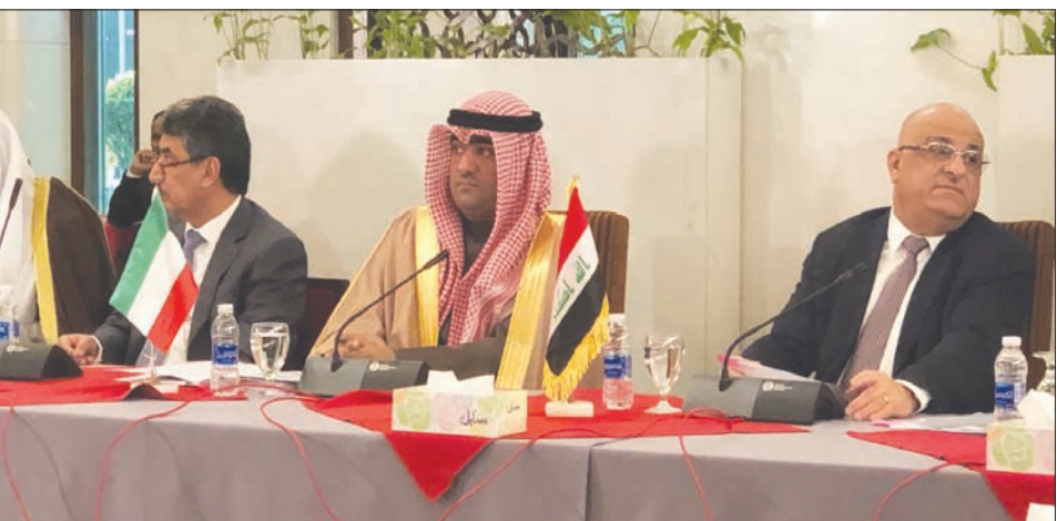
وزيرا التجارة الكويتي خالد الروضان والعراقي محمد العاني خلال جلسة مباحثات أمس

رئيس وزرائه عادل عبد المهدي، ورئيس مجلس النواب محمد الحلويسي، فضلاً عن نظيره العراقي محمد العاني. ويتضمن جدول أعمال الزيارة كذلك لقاءات منفصلة بجهات حكومية، هيئة الاستثمار، وهيئة المنافذ الحدودية، فضلاً عن جهات من القطاع الخاص العراقي، منها اتحاد الغرف التجارية، واتحاد الصناعات والمجلس الاقتصادي.