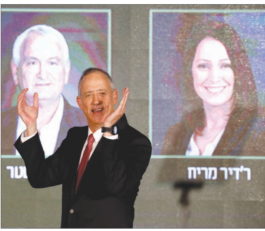
بيبي غانتس زعيم حزب الجنرالات «حصانة إسرائيل» يقدم قائمته الانتخابية أمس في تل أبيب

وجاءت أقوال غانتس في خطابه الانتخابي الثاني، أمام جماهير غفيرة متحمسة، فقوقع مرات عدة بالتصفيق. وقد تعمد الحديث عن تجربته العسكرية، التي دامت نحو 40 عاماً، ليوضح الفارق بينهما ويظهر أيهما هو الجنرال ورجل الأمن الأقوى؛ وذلك لأن نتنياهو كان يواجه منافسيه السابقين (باينر لبيد وافي غباي