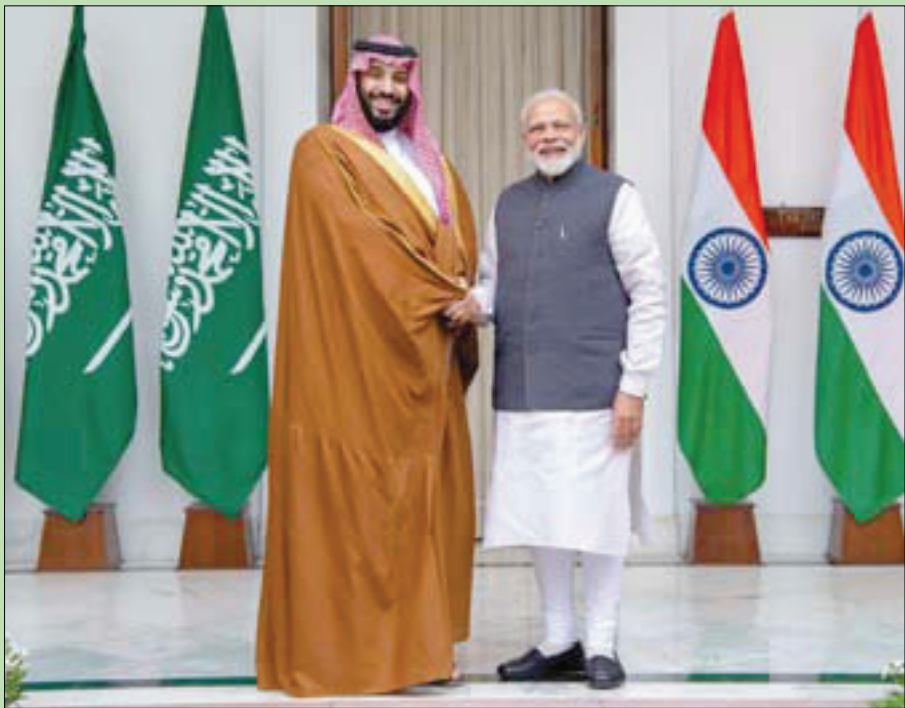
ولي العهد السعودي مصافحاً رئيس وزراء الهند قبل بدء جولة المباحثات الرسمية