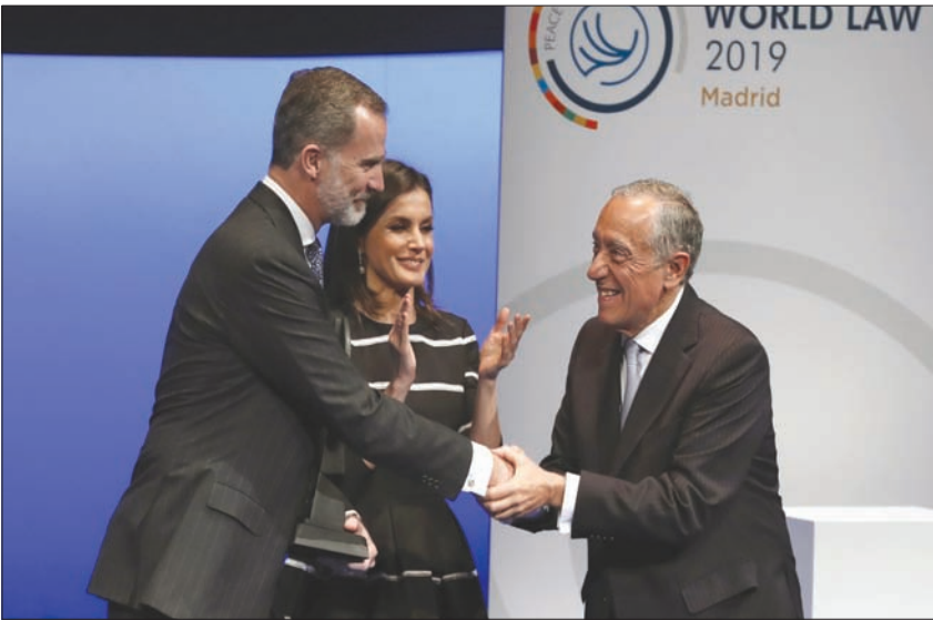
العاهل الإسباني الملك فيليب السادس مع قرينته الملكة ليتيزيا يتسلم الجائزة من الرئيس البرتغالي مرسيليو ريبيلو دي سوزا في مدريد أمس (إ.ب.أ)

الحاليين والسابقين، تحدث باسمهم رئيس الوزراء الإسباني الأسبق فيليب غونزاليس الذي نوه «بالدور البارز والأساسي الذي لعبته الملكية في الدفاع عن النظام الديمقراطي»، وذكر بموقف الملك خوان كارلوس الأول الذي انقذ البلاد من محاولة الانقلاب العسكري الفاشلة في بداية عهد الديمقراطية. وقال غونزاليس الذي تولّى رئاسة الحكومة الإسبانية أربعة عشر عاماً متتالية، واعتذر لاحقاً عن قبول عروض بتولّي رئاسة المفوضية الأوروبية والأمانة العامة للأمم المتحدة: «لا مجال على الإطلاق لممارسة الديمقراطية خارج الإطار الدستوري، ولا يجوز أن يتذرع أحد بالديمقراطية لكي يقوم بظلم للدولة ضد ممثلين للدولة من أجل هدم الدولة».