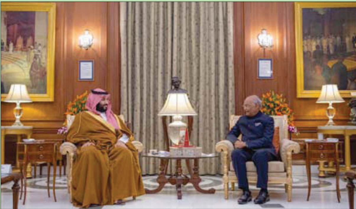
الرئيس الهندي رام نات كوفيند لدى استقباله الأمير محمد بن سلمان قبل حفل العشاء الذي أقامه على شرفه في القصر الرئاسي أمس