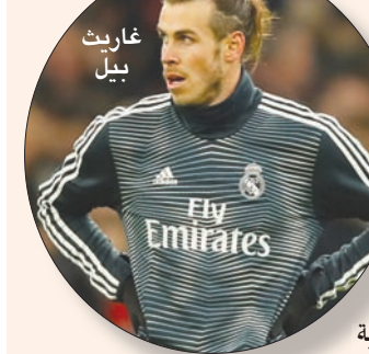
مدريد، الشرق الأوسط

كشفت تقارير صحافية إسبانية أمس، أن إدارة نادي ريال مدريد الإسباني لكرة القدم «فاض بها الملعب» من التراجع المستمر للمستوى الفني للاعب البولندي غاريت بيل وتفكر في بيعه نهاية الموسم الجاري.