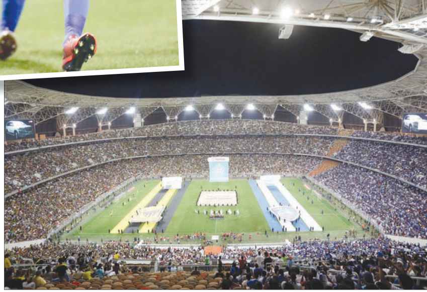
ملعب الجوهرة المشعة بجدة على موعد مع كلاسيكو جماهيري اليوم

أقرب منافسيه، والحفاظ على رتبه الفريق الصاعد من جولة إلى أخرى بفضل الانتصارات المتلاحقة التي حققها الهلال منذ انطلاق القسم الثاني، إضافة إلى انتصاراتهم في مواجهة الذهاب من الدور ربع النهائي من بطولة