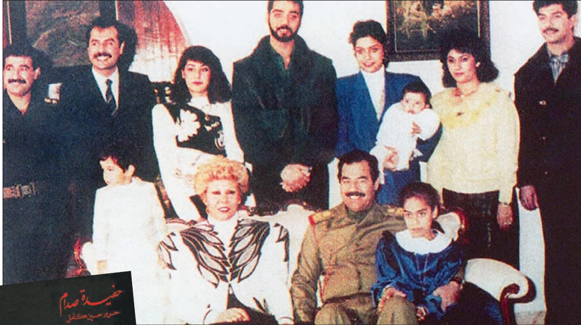
صدام حسين وعائلته. ويبدو حسين كامل أقصى اليسار ورغد الثالثة من اليمين

«العصر الذهبي»، وتقصد به منتصف ثمانينات القرن الماضي؛ حين ولدت وسماها زوجها وحملها بين يديه. وتقول: «كان له طقس لم يكسر منذ أول حفيده له وحتى (استشهاده)، الرجال يسميهم أبائهم وأمهاتهم والنساء (الحفيدات) يسميهم هو بنفسه». وعملية التسمية تتم دائماً بأن «يفتح المصحف الكريم على أي صفحة، ويبدأ القراءة، وإذا صادفه اسم برى أنه يصلح وتنطق عليه الموصافات، سُمِّي به الحفيدة».