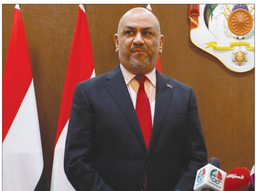
عند: علي ربيع

على الرغم من التقدم الذي أشار إليه المبعوث الأممي إلى اليمن خلال إحاطته أمام مجلس الأمن لجهة تنفيذ اتفاق السويد والاتفاق على المرحلة الأولى من إعادة تنسيق الانتشار في محافظة الحديدة، فإن العملية لاتزال عالقة بسبب عراقيل الحوثيين ومحاولة رئيس فريق المراقبين الدوليين التفاوضي مايكل لوليسغارد تجزئة الحل وعدم حسم مسائل ما بعد إعادة الانتشار.