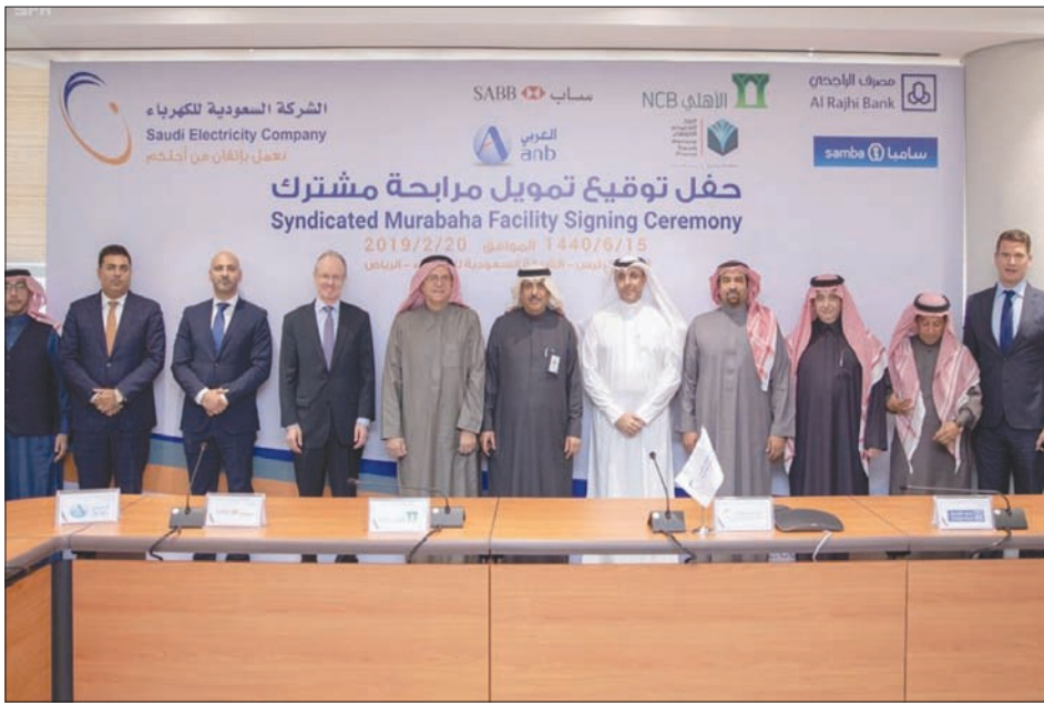
جانب من توقيع الاتفاقية في الرياض أمس