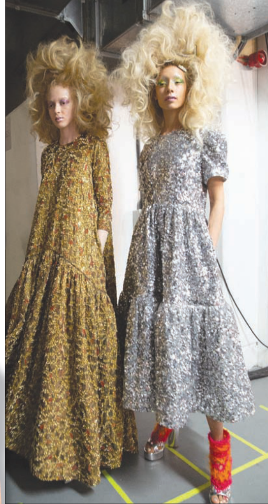
من عرض «أشيش»