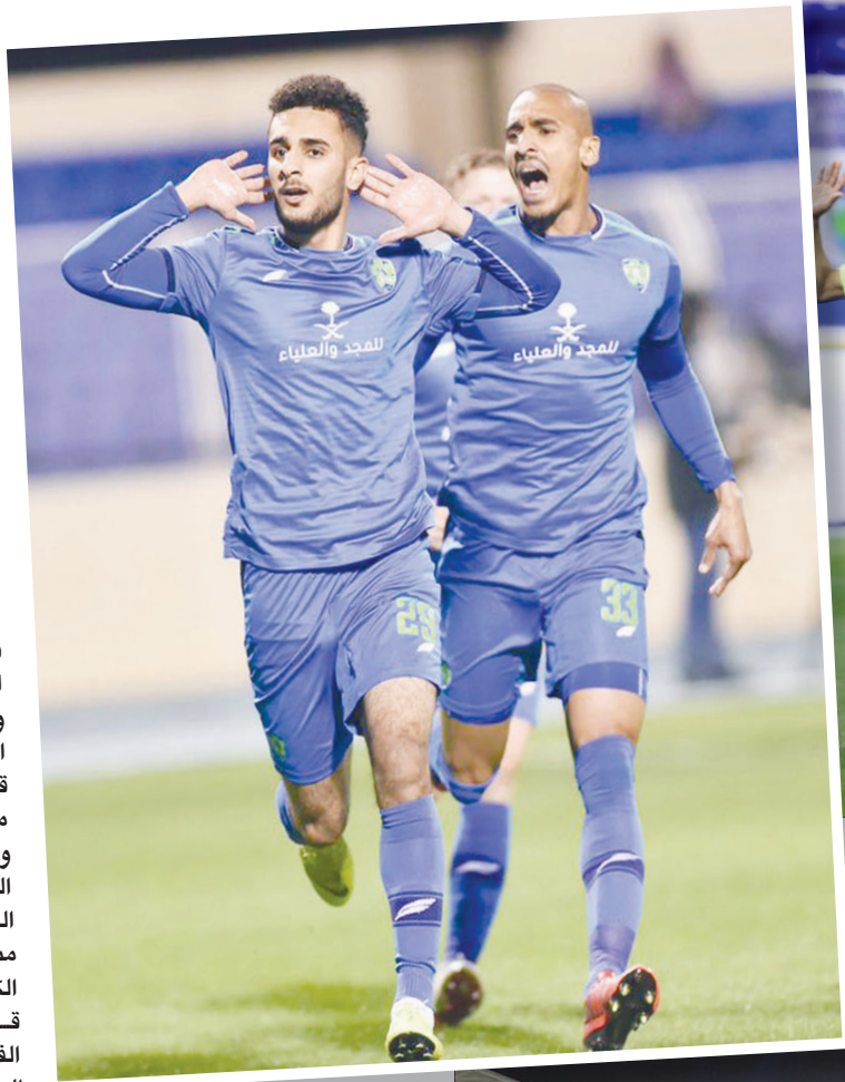
المجد لاعب الفتح يحتفل بهدفه الأول في الأهلي الشرق (الأوسط)

واسعة على النهج الفني للفريق الأزرق مع احتفاظه بغالبية العناصر الأساسية الذين شاركوا في المباريات مع البرتغالي خسيوس، المدرب السابق، ولن يتعدد أصحاب الأرض والجمهور عن الأسماء