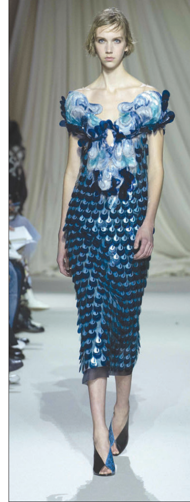
من عرض ماري كاترانزو

وفاته، ولم يبق حبه للترتر عند هذه السطرة، حيث ظهر باخري مملثة، لكن بتصميم عصري، عندما التقى رئيس الولايات المتحدة الأسبق، رونالد ريغان في عام 1984. وحتى نهاية حقبة الثمانينات ظل جزءاً من الأزياء الراقية، قبل أن تتراجع شعبيته في التسعينات، الحقبة التي طبعها الأزياء الهائلة. في الألفية عاد من باب الطبقات الأرستقراطية، حيث ظهرت به الملكات والأميرات. في عام 2011، اعتلته ملكة إسبانيا ليتيزيا من خلال ستره غلظتها حبات الترتر الأسود مع باقة من الساتان اللامع، نسقتها مع بنطلون رسمي أسود وبلوزة بيضاء. بعد عام واحد ظهرت الأميرة فيكتوريا، ولية عهد السويد، بفستان يبرق بالترتر الأخضر في حفل توزيع جوائز نوبل في استوكهولم.