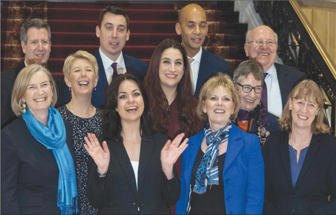
ثلاثة أعضاء من حزب المحافظين الحاكم يقفون في الصف الأمامي بعد انضمامهم أمس إلى ثمانية أعضاء ممن استقالوا من حزب العمال في اليوم السابق ليشكلوا «مجموعة مستقلة» داخل البرلمان

مصانع أو نقل مؤسسات خارج بريطانيا منذ أشهر. وقبل أقل من ستة أسابيع من الموعد الرسمي لخروج بريطانيا من الاتحاد الأوروبي، تضاربت مخاوف بريكست من دون اتفاق بسبب غياب حل لمسألة «شبكة الأمان» الخاصة بحدود أيرلندا. وتطالب ماي بـ«تغييرات ملزمة» لهذا الإجراء الذي يرفضه أنصار بريكست. وتأمل في الحصول على الضوء الأخضر من البرلمانيين البريطانيين لاتفاق بريكست بعد مايكل روث «الذي يكون للتأجيل معنى إلا في حال طرح أفكار جديدة بحسب حسية على الطاولة»، داعياً لندن إلى «تقديم مقترحات واقعية بسرعة».