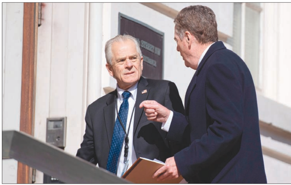
مسؤول التجارة الأميركي روبرت لايتهايز مع مستشار البيت الأبيض بيتر نافارو يتجهان لأحد الاجتماعات مع الوفد التجاري الصيني

واشنطن، «الشرق الأوسط» قال الرئيس الأميركي دونالد ترمب إن المباحثات التجارية مع الصين تمضي على نحو جيد، ولح هذا الموعد النهائي. وأبلغ ترمب الصحفيين في المكتب البيضاوي قائلًا، إنها «مباحثات معقدة للغاية. هي تمضي على نحو جيد للغاية... لا يمكنني أن أعطيكم موعدًا بالضببط، لكن الموعد ليس مقدسًا. يمكن أن يحدث كثير من الأمور». وقال ترمب إن السؤال الحقيقي هو ما إذا كانت الولايات المتحدة ستترفع الرسوم الجمركية وفقًا لما هو مخطط. وأضاف: «أعرف أن الصين لن ترغب في أن يحدث هذا. ومن ثم فإننا نعتقد أنهم يحاولون التحرك بسرعة لكي لا يحدث هذا». واطلقت الولايات المتحدة والصين يوم الثلاثاء جولة جديدة من المباحثات في واشنطن، وستعقد جلسات متابعة في وقت لاحق من هذا الأسبوع. وجاءت