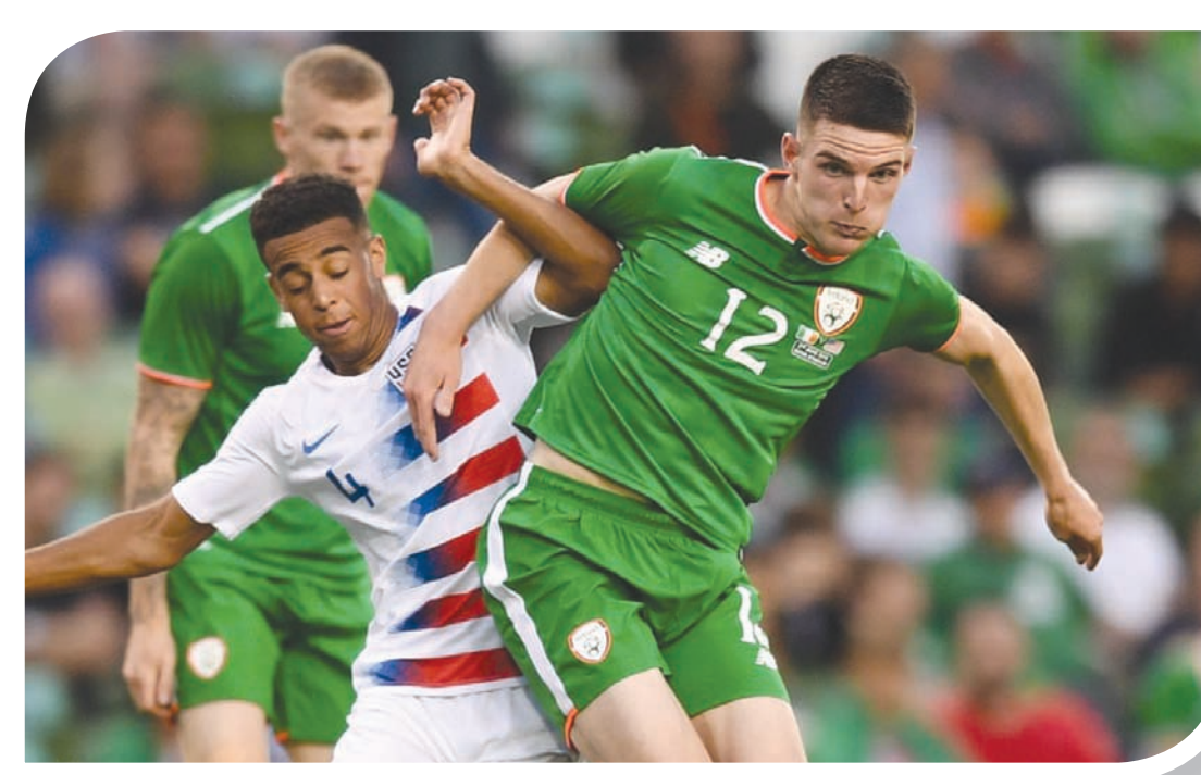
قرار رايس أغضب كثيراً من الأيرلنديين

عندما يكون لدى اللاعب جنسيتان مختلفتان، فأنا، على سبيل المثال، لدى الجنسية البريطانية والنيجييرية، ونفس الأمر ينطبق على لاعبين آخرين مثل نجم ليفربول آدم لالانا الذي يحمل الجنسية الإنجليزية والإسبانية، ولو بحثت بشكل أكبر فسوف تجد أن الكثير من اللاعبين الإنجليز لديهم أصول ويلزية أو اسكتلندية. وهناك مثل آخر في هذا الصدد، وهو نجم مانسترس سيتي رحيم ستريينغ الذي يفخر بجذوره الجامايكية، لكنه يلعب لمنتخب إنجلترا ويفتخر بذلك أيضاً.