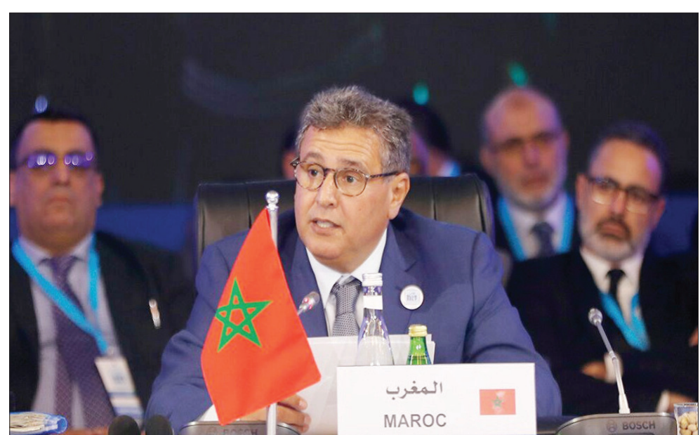
عزيز أخنوش وزير الفلاحة والصيد البحري المغربي في افتتاح مؤتمر مبادرة «الحزام الأزرق»

أغادير، لحسن متّع (تشرين الثاني) 2016. ويبلغ طول السواحل الأفريقية 28 ألف كيلومتر، موزعة بين المحيط الأطلسي والمحيط الهندي والبحر الأحمر والبحر الأبيض المتوسط. وتساهم أفريقيا بحصة 7 في المائة في إنتاج قطاع الصيد البحري في العالم، كما تساهم بحصة 3 في المائة في التجارة الدولية للأسماك ومنتجات البحر. وتعايني الثروة السمكية في أفريقيا من الاستنزاف المفرط، بسبب الاستغلال العشوائي وممارسة الصيد خارج القانون، من طرف كثير من السفن غير المصرح بها، وغير المرخص لها، إضافة إلى إبرام الدول الأفريقية لاتفاقيات صيد غير متوازنة مع كثير من الشركاء، خاصة اتحاد الأوروبي وروسيا والصين. وتهدف مبادرة «الحزام الأزرق» إلى تضافر جهود 39 دولة أفريقية مطلة على البحر، من أجل إرساء أسس التعاون المتحر في هذا المجال، وإرساء قواعد اقتصاد أزرق مستدام تساهم في التنمية وتعزيز الأمن الغذائي. وانعقد مؤتمر «الحزام الأزرق» عشية افتتاح معرض «اليوتيس» للصيد البحري في دورته الخامسة أمس بأغادير. ويشكل معرض «اليوتيس»، الذي ينظم مرة كل سنتين، مناسبة لتقييم الاستراتيجية المغربية في مجال الصيد البحري، وأيضاً لتعزيز الشراكات المغربية من خلال النشاط الدبلوماسي المكثف، ولقاءات الأعمال التي تتخلله، إضافة إلى توقيع كثير من الاتفاقيات خلال