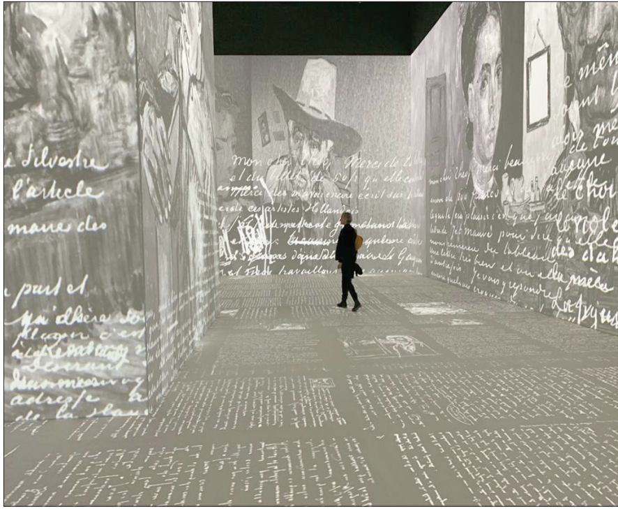
عرض بانورامي للوحات فان غوخ