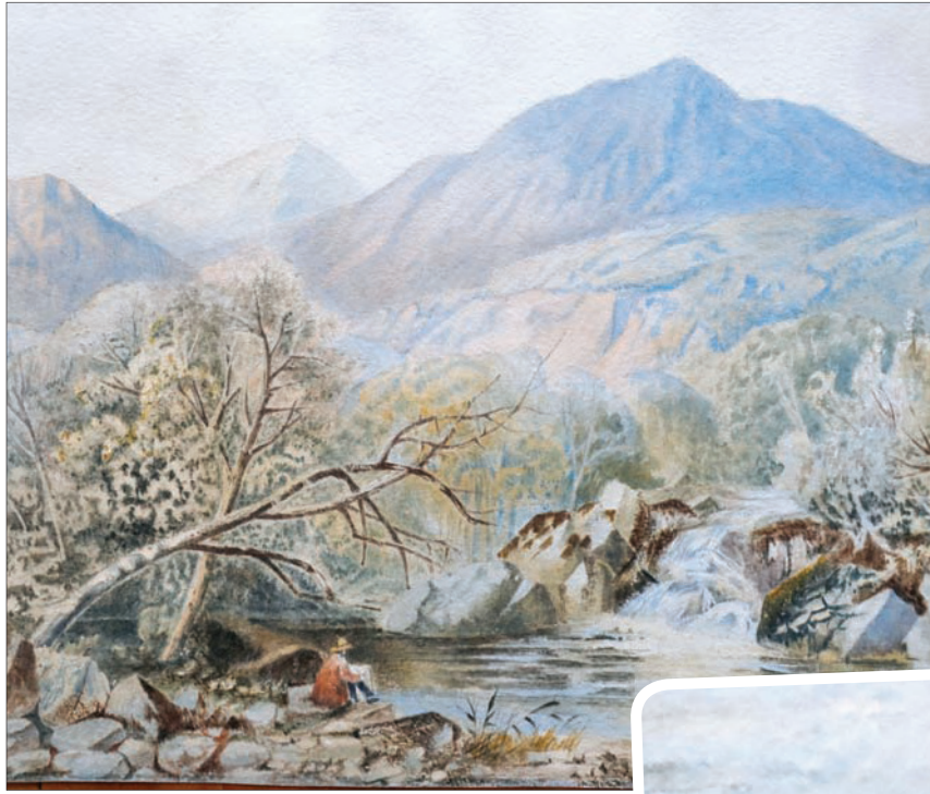
اللوحة الأخرى

وتشير الصحيفة إلى أنه حتى الخبراء الفنيين يجدون صعوبة في تأكيد لوحات هتلر، لأنه لم يكن لديه أسلوب خاص في الرسم، وهو بوصف بأنه كان مجرد رسام «ناقل» لا يتمتع بموهبة كبيرة. كما لا لهتلر إضاءات قليلة تم التأكيد من مصداقيتها وهي لا تشبه كثيراً التواقيع على اللوحات. وفي السنوات الماضية، ظهر رجل أعمال من تكساس يدعى بيلى برايس يجمع لوحات هتلر ويبدو أن مجموعته وصل عددها إلى 750 لوحة. وعام 2015، بيعت لوحات لهتلر في المزاد العلني