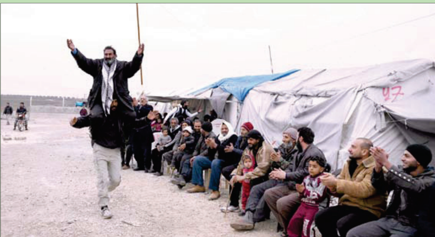
خلال عرس في مخيم للنازحين بدير بلوط في ريف حلب أمس، ويبدو والد العريس محمولاً على الكتفين

لندن، إبراهيم حميدي قدمت موسكو إلى أنقرة اقتراحاً بتفعيل «اتفاق أضنة» الذي يعود إلى عام 1998 ويسمح للجيش التركي بالتوغل شمال سوريا بعمق 5 كيلومترات كي يكون تنفيذ هذا الاتفاق بديلاً من خطة بين أنقرة وواشنطن بإقامة «منطقة عازلة» بعمق 32 كيلومتراً. «اتفاق أضنة»، الذي تنشر «الشرق الأوسط» نصه وملحقاته، أنجز بين الحكومتين التركية والسورية في يوليو (تموز) 1998 وأقر رسمياً بعد 3 أشهر، وجذب أنقرة ودمشق حرباً كانت تركيا لوحت بشنّها بعدما حشدت قواتها على الحدود السورية. وترمي موسكو، بحسب دبلوماسيين غربيين، من تنفيذ الاتفاق إلى دفع أنقرة ودمشق إلى تقديم 10 تنازلات متبادلة، بينها «إعطاء تركيا الحق بملاحقة حزب العمال الكردستاني لعمق 5 كيلومترات شمال سوريا» وتخلي دمشق عن أي مطالبة بلواء إسكندرون (إقليم هاتاي) الذي ضمته تركيا في 1939 عبر الاعتراف بالحدود القائمة، إضافة إلى اعتبار «حزب العمال الكردستاني» التركي «تفخيميا إرهابياً». ويتطلب تنفيذ اعتراف أنقرة بشرعية الحكومة السورية وتبادل فتح السفارات؛ لأن الاتفاق يتضمن كثيراً من الإجراءات، بينها تشكيل لجنة مشتركة وتشغيل خط ساخن بين أجهزة الأمن وتعيين ضابط ارتباط أممي في كل سفارة، إضافة إلى احتمال انتشار القوات السورية على الحدود التركية بضمانة الشرطة الروسية. (تفاصيل ص 6)