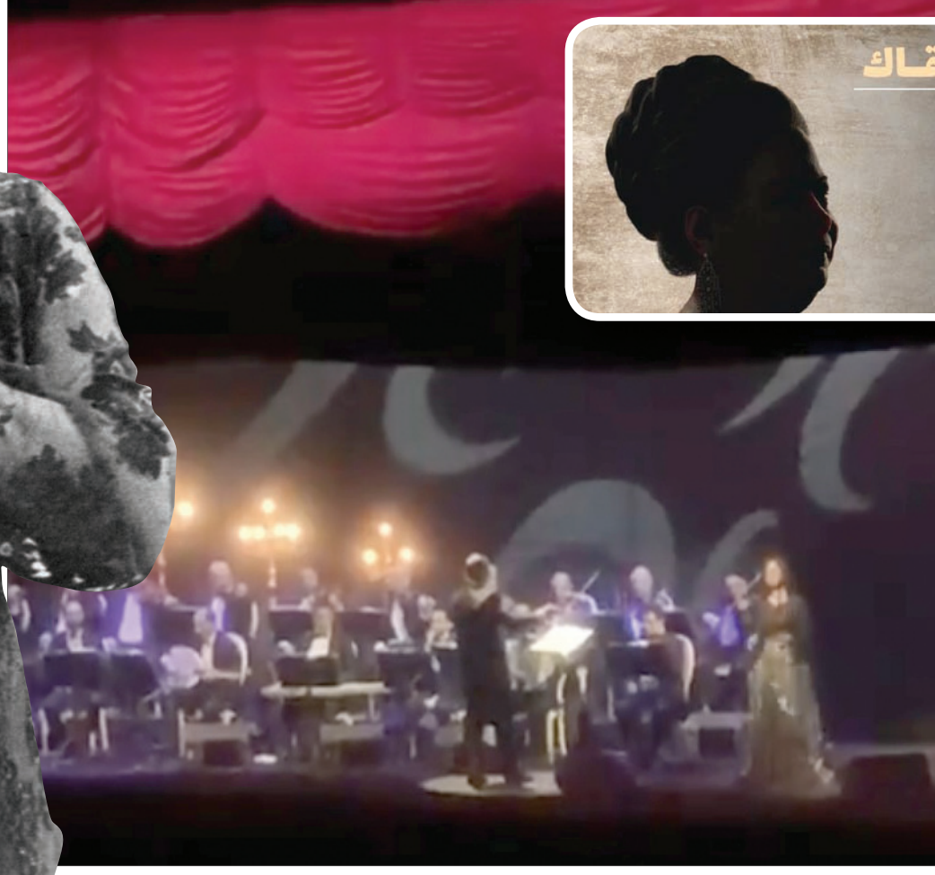
لقطة من الحفل

آخر شببيه، حيث قامت الفنانة المصرية صابرين، بإهداء شخصية الفنانة. وضمت أجندة أم كلثوم الغنائية في الحفلة (أغاني: ألف ليلة وليلة، وسيرة الحب، وأنت عمري وغيرها، كما تضمنت الليلة الفنية لأم كلثوم، عروضاً في متحف مفتوح لتاريخ الفنانة، وصور خاصة، علاوة على أدوات فرقتها. وشهد الحفل حضوراً فنياً وبدأت الليلة الطربية، بإداء موهبتين مصريتين بعضاً من أغاني الفنانة أم كلثوم، وهما المطرب الشاب محمد الشرنوبلي، والمطربة سناء نبيل، وهي حفيدة الفنانة الراحلة وكانت صاحبة الأداء الذهبي نظراً لما تملكه من حنجرة أشبه بجدها أم كلثوم.