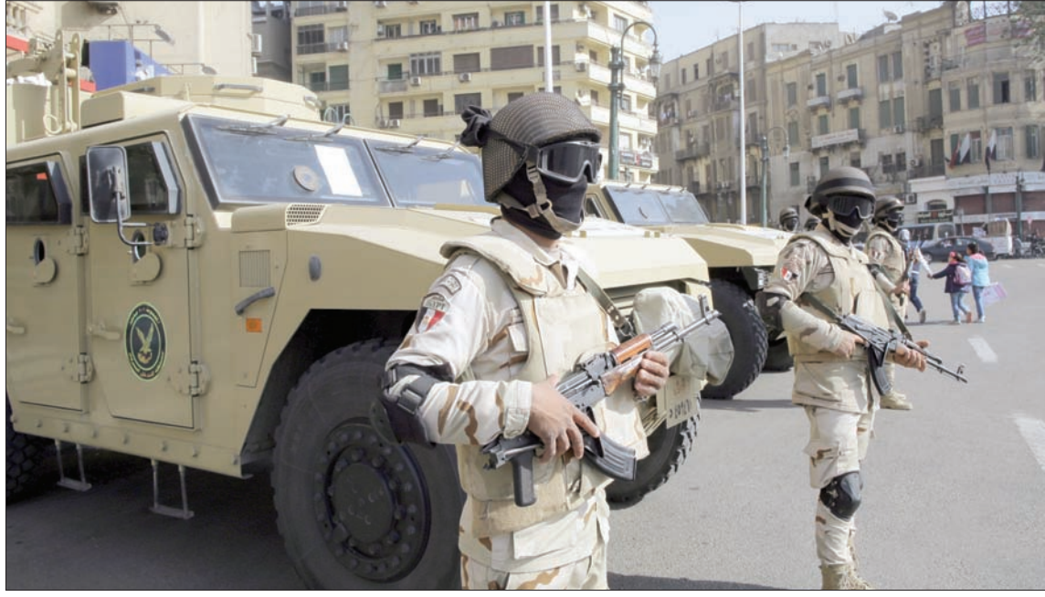
عناصر من قوات الأمن المصرية في ميدان التحرير بالقاهرة أمس في الذكرى الثامنة للانتفاضة 11 فبراير 2011

القاهرة، وليد عبد الرحمن عززت الأجهزة الأمنية في مصر أمس من وجودها بمحيط مؤسسات الدولة والمنشآت الحيوية أمس، تزامناً مع الذكرى الثامنة لثورة 25 يناير (كانون الثاني) التي أطاحت بنظام حكم الرئيس الأسبق حسني مبارك عام 2011، وبمناسبة احتفالات عيد الشرطة. ونشرت وزارة الداخلية مجموعات أمنية في الشوارع، وقوات التدخل والانتشار السريع، وكثفت انتشار الارتكازات المسلحة بجميع المحاور المرورية والمناطق المهمة والحيوية للحفاظ على الأمن.