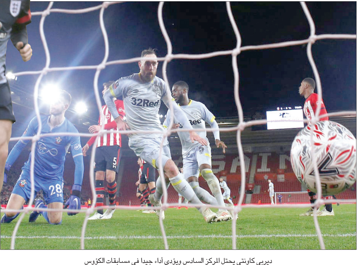
ديربي كاوتي يحتل المركز السادس ويؤدي أداء جيداً في مسابقات الكؤوس

شيفيلد يونايتد (المركز الرابع - 50 نقطة) ما زال المدير الفني الإنجليزي كريس وايلدر ناجحاً في مساعدة لاعبيه على تقديم أفضل ما لديهم، وقد أكد في ديسمبر (كانون الأول) الماضي أن فريقه الفريق أقوى خط هجوم في