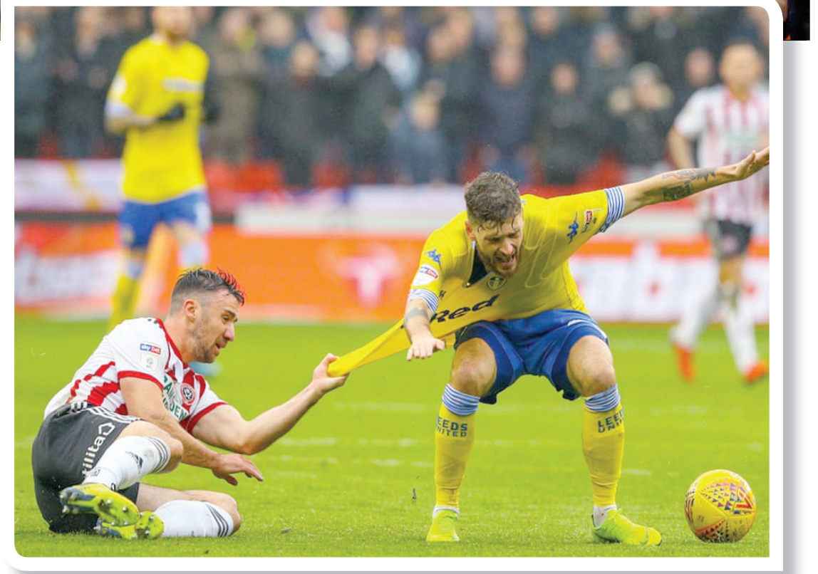
ليدز يتصدر جدول الترتيب في وقت يسعى شيفيلد يونايتد إلى إزاحته

شيفيلد يونايتد (المركز الرابع - 50 نقطة) ما زال المدير الفني الإنجليزي كريس وايلدر ناجحاً في مساعدة لاعبيه على تقديم أفضل ما لديهم، وقد أكد في ديسمبر (كانون الأول) الماضي أن فريقه الفريق أقوى خط هجوم في