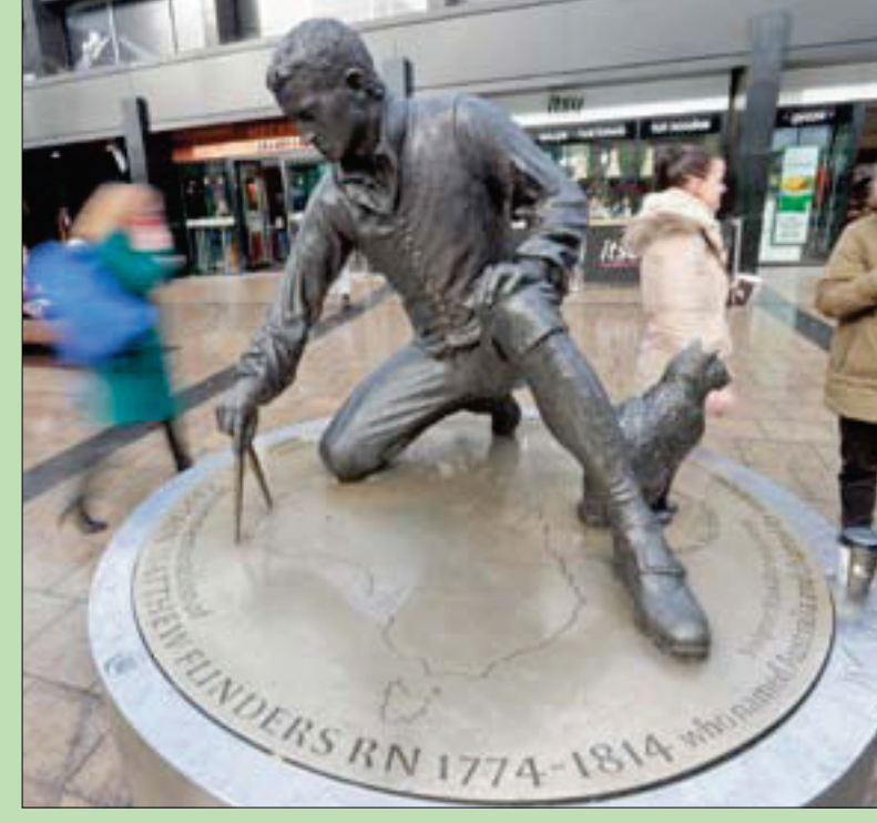
تمثال فليندرز في محطة قطارات يوستون في لندن