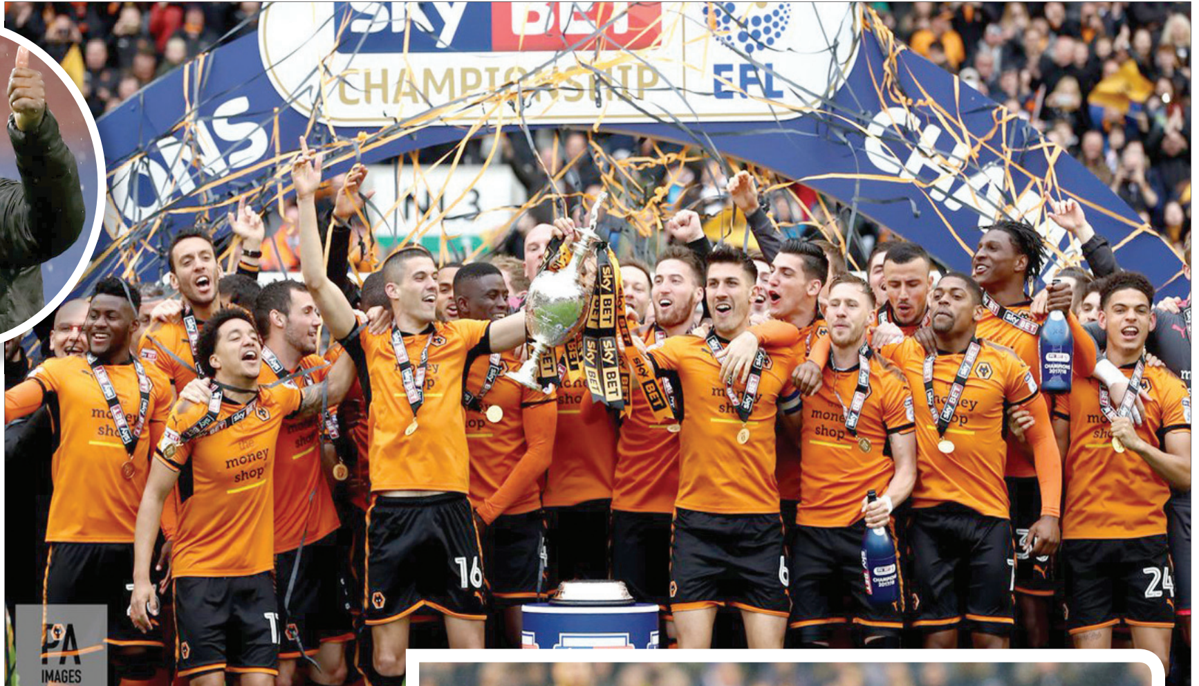
تتويج ولغرفهامبتون بدوري الدرجة الأولى الإنجليزي الموسم الماضي

التأهل للمواجهات الفاصلة، بعد فوزه 2 - 1 على ضيفه ريدنغ في مباراته الأخيرة يوم السبت الماضي. وفاز كول، طوال مسيرته، التي لمع خلالها ضمن صفوف نادي تشيلسي وأرسنال، بثلاثة ألقاب في الدوري الإنجليزي وسبعة ألقاب أخرى في بطولات الكأس الإنجليزية المختلفة، ولقب وحيد في بطولة دوري أبطال أوروبا ولقب في الدوري الأوروبي، بالإضافة إلى بعض الألقاب الأخرى. (التوقعات: الوصول للمتحقق التأهل للدوري الإنجليزي الممتاز)