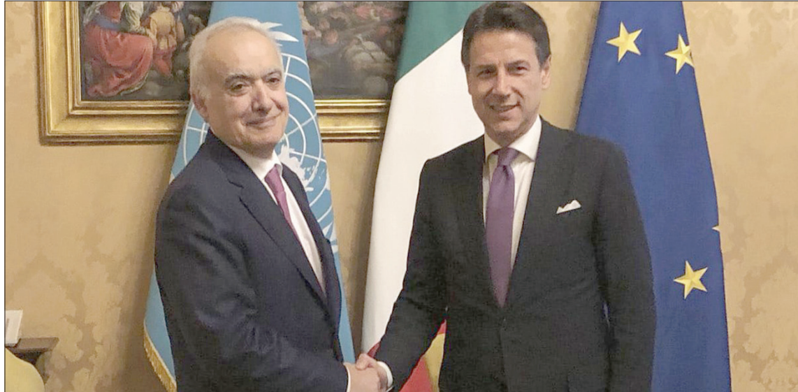
البعوث الأممي غسان سلامة ورئيس الوزراء الإيطالي جوزيبي كونتي في روما (البعثة الأممية)

بسطت القوات المسلحة الليبية قبضتها، أمس، على أهداف استراتيجية عدة، كانت في حوزة بعض «الجماعات الإجرامية»، أبرزها مطار سبها الدولي والقلعة التاريخية بالمدينة، وفندق الجبل، وذلك في إطار تحرك قوات الجيش الوطني، بقيادة المشير خليفة حفتر، لتطهير مدن الجنوب من «الجماعات الإرهابية والعصابات المسلحة».