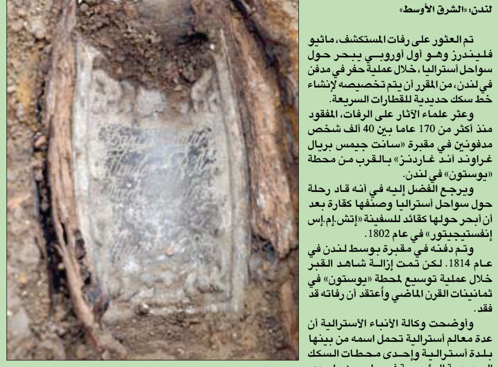
لوحة من الرصاص فوق كفن الكابتن فليندرز

ويبلغ عدد زوار تاج محل، الذي شيده إمبراطور مغولي لزوجته، 25 ألف زائر يوميا، ويرتفع العدد إلى 80 ألفا خلال ذروة الموسم السياحي. كما تنشر قرود المحاك ريسوسي الفوضي في نيودلهي، حيث تخطف الطعام والهواتف الجواله وتقتحم المنازل وتروع السكان في العاصمة الهندية وحولها.