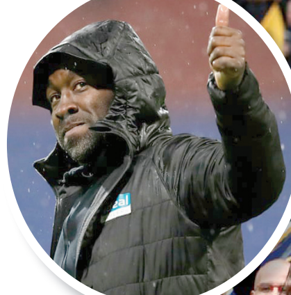
المدرّب دارين مور يقود وست بروميتش البيون إلى عودة سريعة للدوري الممتاز

وعلى أرض الواقع، فإن الفريق ينافس بقوة على المركز الأول حتى الآن، وربما تكون المشكلة الأكبر التي تواجه الفريق تتعلق بالهجوم، في ظل اعتماد الفريق بشكل كامل على كل من بيلي شارب وديفيد ماكغولفريد في إحراز الأهداف. وبعد عودة بين وودبيرن إلى ليفربول بعد