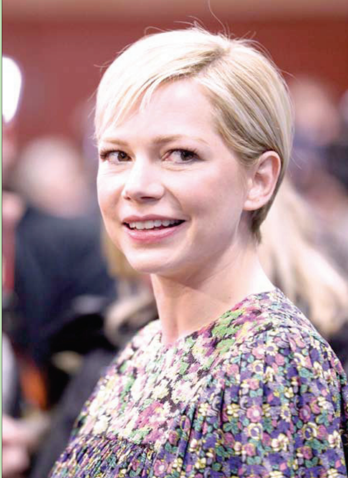
الممثلة الأميركية ميشيل ويليامز تصل لحضور العرض الأول لفيلم «عقب الزواج» في مهرجان «صاندانز» في بارك سيتي - ولاية يوتا

هل صحيح أن الجمال فكافه الصيف، يسهل الحصول عليها، ويصعب الاحتفاظ بها؟