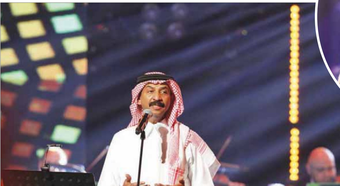
المحّن والمغني السعودي عبادي الجوهري