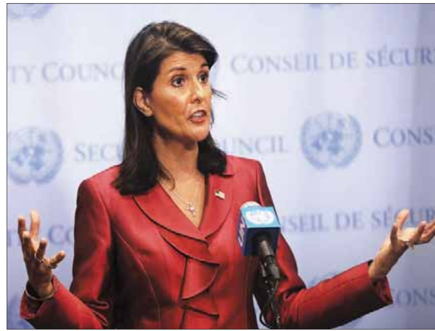
السفيرة الأميركية في الأمم المتحدة تيلي بتصريحات عن إيران مساء أول من أمس

قضية «نوووي إيران» ورغبة ترمب في إبرام اتفاق جديد تلك المحادثات.