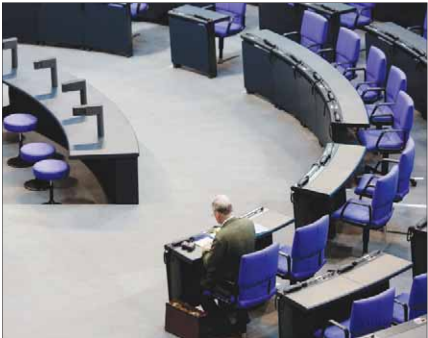
ألكسندر غولاند النائب عن حزب «البديل» ينتظر انطلاق جلسة في البرلمان الألماني

بعودة «الفاشية»، ونسُد رينيه سيرينغر، الذي نعته نائب آخر بـ«النازي»، بـ«اندثار في الخطاب» يذم عن «قدر من الهستيريا» لدى الأحزاب التقليدية. لكنه أكد أن «إبقاء التيارات الأكثر تطرفاً تحت مظلة» الحزب، وهي تيارات قريبة من النازيين الجدد، كما نقلت عنه وكالة الصحافة الفرنسية.