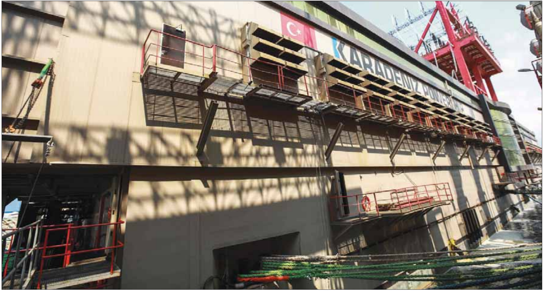
السفينة التركية «فاطمة غل سلطان» أمام بلدة «ذوق مصباح» تمتد بعض مناطق لبنان بالكهرباء

أحد الأسباب الرئيسية للجزع والدين العام». كذلك قال الوزير النائب السابق بطرس حرب، عبر حسابه على «تويتر»: «ادعو اللبنانيين إلى الاستماع إلى ما قاله جابر، الوزير النائب السابق وليد جنبلاط، في تغريدته عبر حسابه على «تويتر»، قائلاً: «في ملف الكهرباء، ليت المعنيين يسمعون ما قاله ياسين جابر: صوت مدوي يخضم إلى الحريصين على المصلحة العامة، يفضح مهزلة البواخر التركية التي هي تعودتم... واستطرد، (سيمنز) لم تشارك في أي مناقصة». ولأقوى كلام جابر ردود فعل من قبل شخصيات وأقرباء لبنانيين، حيث علّق رئيس «الحزب التقدمي الاشتراكي»، الوزير النائب السابق وليد جنبلاط، في تغريدته عبر حسابه على «تويتر»، قائلاً: «في ملف الكهرباء، ليت المعنيين يسمعون ما قاله ياسين جابر: صوت مدوي يخضم إلى الحريصين على المصلحة العامة، يفضح مهزلة البواخر التركية التي هي