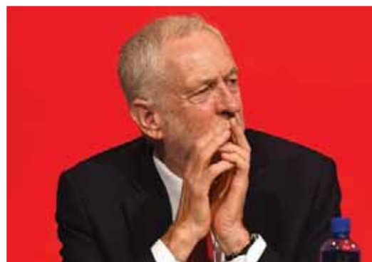
جيريمي كورين خلال مؤتمر حزب العمال السنوي في ليفربول أمس (أ.ف.ب)