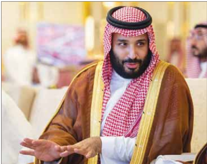
الأمير محمد بن سلمان ولي العهد السعودي خلال رعايته الحفل الختامي لمهرجان ولي العهد لهجن في الطائف أول من أمس (واس)

ما أكرم به بلادنا من خدمة الحرمين الشريفين، ورعاية الحجاج والمعتمرين والزوار، وهي رعاية تجلت في النجاح الكبير لموسم الحج الأخير، والشأن الدائم ممن أكرمه الله بآداء النسك على جهود حكومة المملكة العربية السعودية وشعبها المضيايف، وحرصها الدائم على التطوير المستمر للمشاعر المقدسة والخدمات، بما يكفل أداء النسك بكل يسر وسهولة.