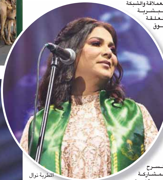
المطربة نوال الكويتية

وشملت الفعالية التي أقيمت على طريق الملك عبد العزيز عرضاً لإنجازات الشباب السعودي بهدف التعريف بالمبدعين الشباب الذين يقع على عاتقهم بناء المستقبل، ومواكبة التطور للرفي في المملكة إلى مصاف الدول العظمى. كما أقيمت عروض بهلوانية ومسرحية، إضافة إلى عرض لالأسواء والسليزر، وشاهد الحضور عروض الدمى العملاقة والشبكة البشرية المعقدة فوق