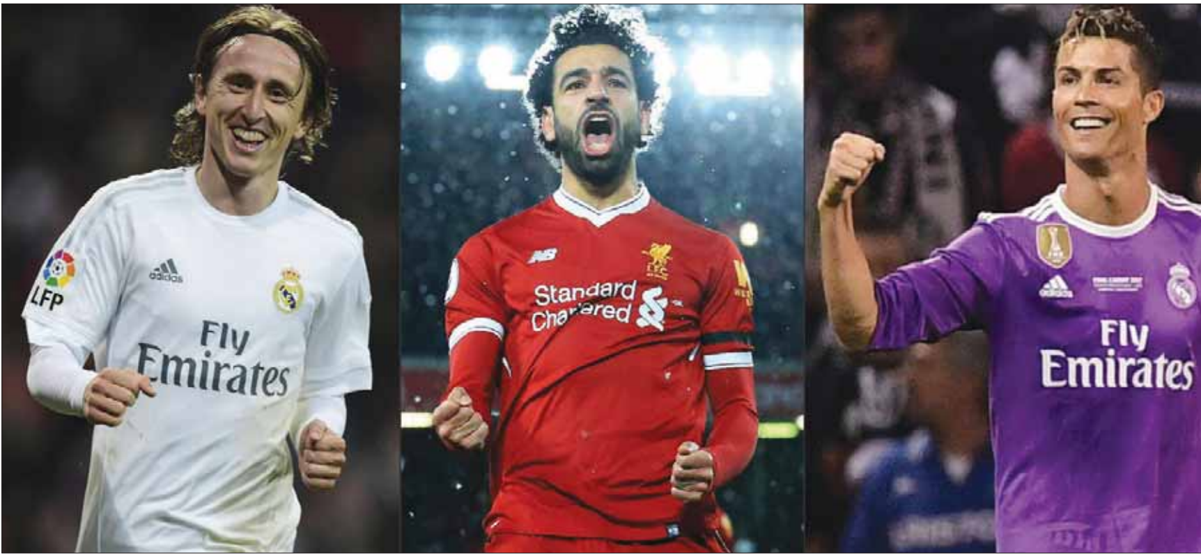
رونالدو وصلاح ومودريتش يتنافسون على جائزة أفضل لاعب بالعالم اليوم

ماروزان لاعباً ليون بطل فرنسا وأوروبا مع البرازيلية مارتا على جائزة أفضل لاعبة في العالم. وقادت مارتا المنتخب البرازيلي للقب كأس أمم أمريكا الجنوبية (كوبا أميركا) للسيدات. وتنافس المديرة سارينا فيغمان الفائزة بجائزة أفضل مدرب كرة نسائية في العالم لعام 2017 على نفس الجائزة في العام الحالي بعدما قادت المنتخب الهولندي للسيدات إلى الفوز باللقب الأوروبي.