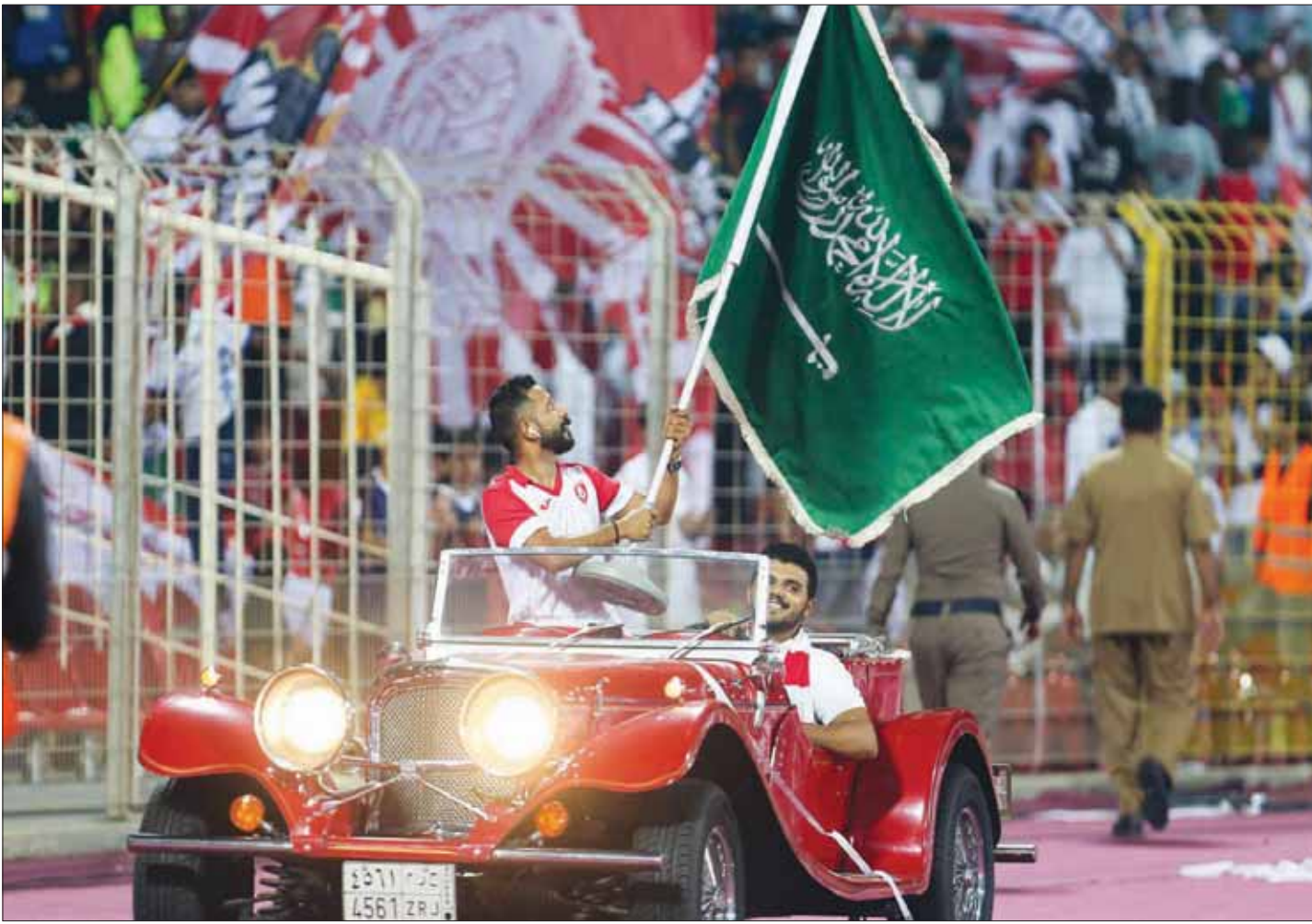
من الفعاليات التي شهدت جولة الوطن في دوري الأمير محمد بن سلمان

وشاركت الجماهير الرياضية الإماراتية السعوديين في احتفالهم بيومهم الوطني، بعدما خصصت لجنة دوري المحترفين في الإمارات مباريات الجولة الثالثة من دوري الخليج العربي للمحترفين للاحتفال باليوم الوطني السعودي، واستعدت وربطت الأندية الإماراتية لهذه المناسبة بشكل مختلف وغير مستغرب، حيث زينت الملاعب التي احتضنت مباريات الجولة الثالثة بالأعلام السعودية ونفاغت الجماهير مع اليوم الوطني السعودي، وأرادت اللاعبون أثناء دخولهم للملاعب أوشحة سعودية، دون القائلون على لجنة دوري المحترفين الإماراتي في حسابها الرسمي على «تويتر»، صاحب دوري الخليج العربي تزيين بأعلام المملكة العربية السعودية احتفالاً باليوم الوطني الـ88.