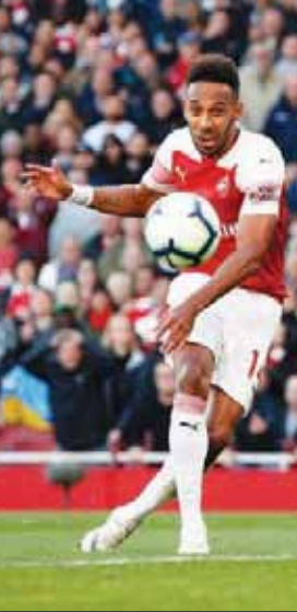
أوباميانغ يسجل ثاني أهداف أرسنال في مرمرى إيفرتون وهو في موقف تسلل

كبيرة في فك التكتل الدفاعي لوستهام فلجأ لاعبو إلى التسديد من بعيد، حيث جرب الدفاع الألماني أنطونيو رودرغ حظه من خارج المنطقة بين يدي الحارس البولندي لوكاس فابيانسكي في الدقيقة 10، ثم تلقى الكرة البلجيكي إدين هازار كرة داخل المنطقة سدها قوية بين يدي فابيانسكي.