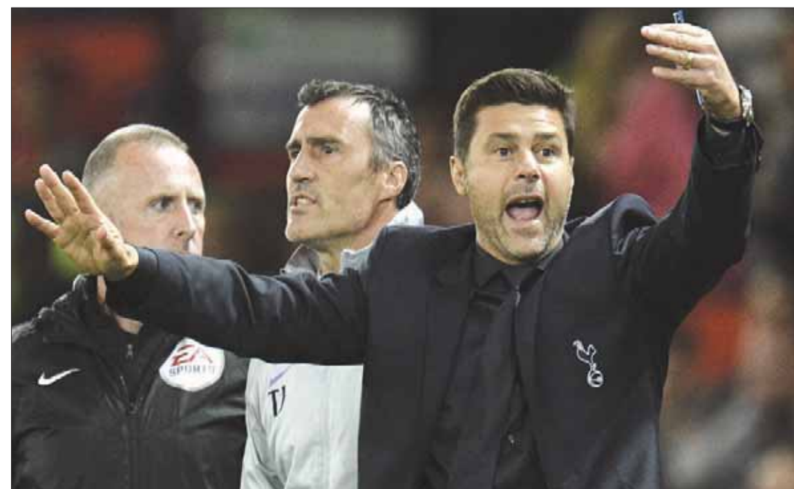
بوكيتينو غاضب من أسئلة الصحافيين

هذا العالم، ولم تركلوا كرة القدم في إنجلترا تنظر بازدياداً إلى وجهات النظر المطروحة ممن لم يلعبوا كرة القدم من قبل. ويرى المدربون الفتيون أنهم يُعاملون بعدم احترام مجرد طرح الأسئلة عليهم من الصحافيين أو الجمهور، وكانهم يقولون: كيف تجرؤون على طرح مثل هذه الأسئلة، وأنتم تعيشون خارج