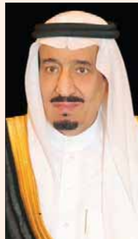
جدة، الشرق الأوسط،

هنا خادم الحرمين الشريفين الملك سلمان بن عبد العزيز أبناء شعبه بمناسبة ذكرى اليوم الوطني الـ 88 لبلادهم، وقال في تغريدة على «تويتر»: «الحمد لله الذي من على بلادنا بنعمة الأمن والأمان والاستقرار، وأكرمتنا بخدمة الحرمين الشريفين».