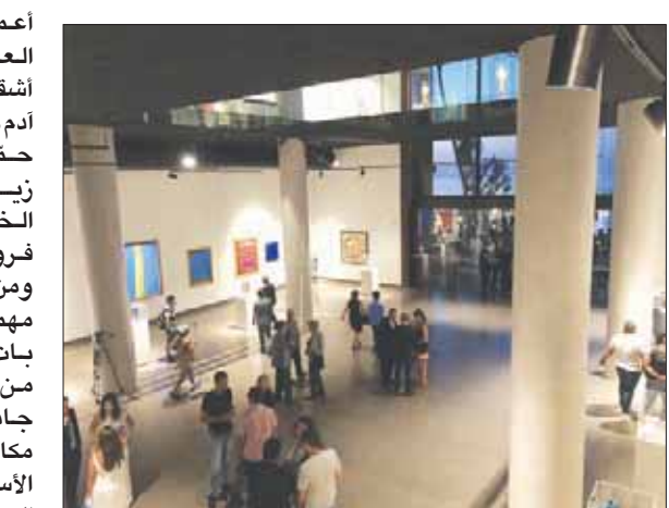
المتحف من الداخل

«متحف نابو» الذي يحمل اسم إله الكتابة والحكمة في بلاد ما بين النهرين، افتتح يوم السبت الماضي، بحضور عدد كبير من المهتمين الذين لم يدهشوا بالأحاديث التي تمشي خفيًا على خطى الشاعرة الإيرانية الكبيرة فروغ، والتي تسعى بخطى خفيفة لتكريس خطابها الشعري الجديد في ذات الأبعاد الجمالية والأخلاقية والإنسانية، وهي المجموعة الأولى التي تترجم للعربية بعد