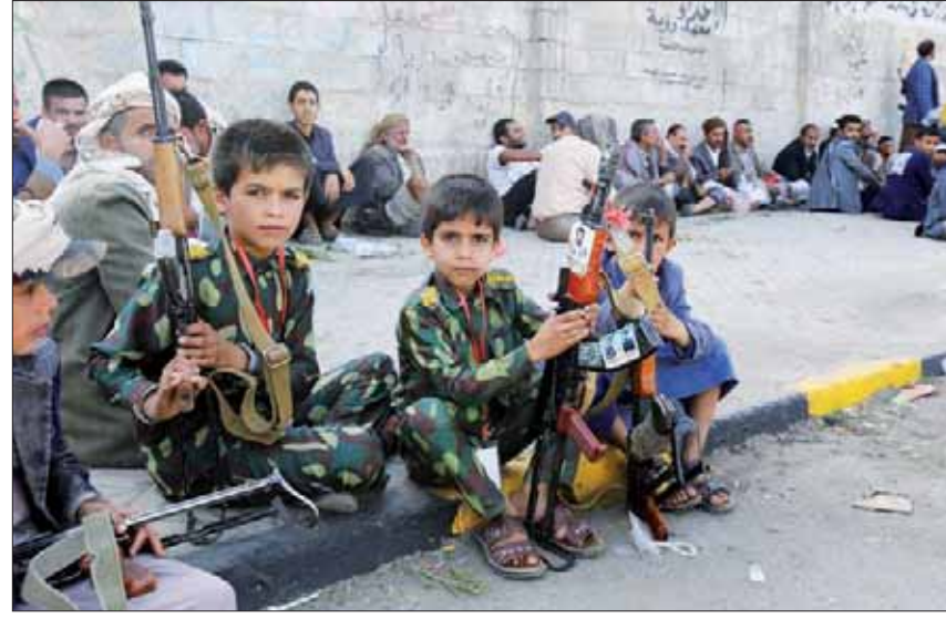
أطفال يمنيون يمسكون بأسلحة في تجمع حوثي وسط صنعاء

الموارد وتجهيل الشعب. وكما يصف الناشطون اليمنيون «نكبة الحوثي» في 21 سبتمبر 2014، بأنها أسست لكل الكوارث التي عايشها اليمنيون من قتل وتهجير وتفجير للمنازل وحملات قمع يؤكدون أنها أحدثت شرخاً عميقاً في النسيج اليمني لن تحمي آثاره على المدى الطويل.