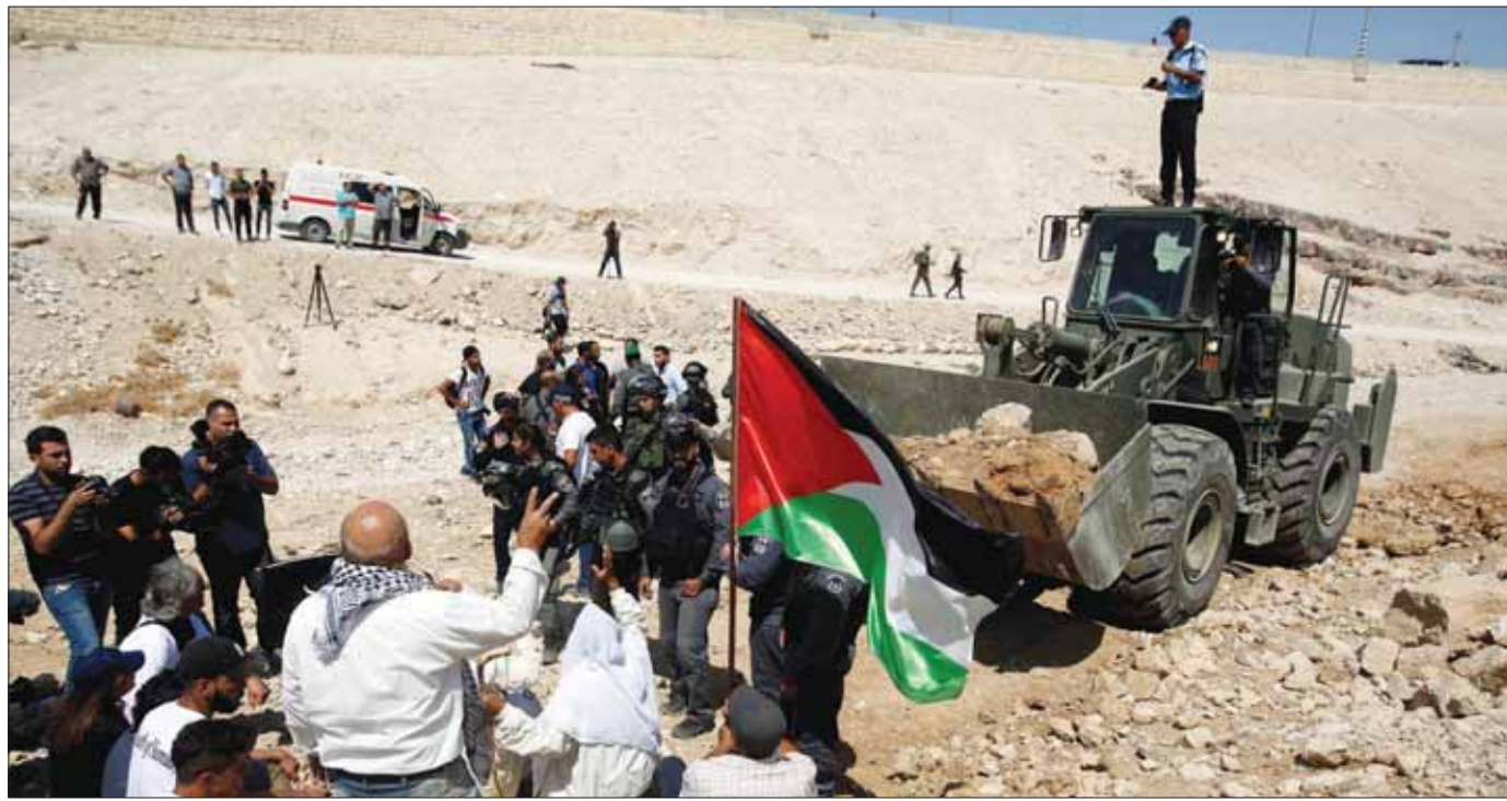
فلسطينيون تجمعوا في مواجهة جرافة تحرسها قوات إسرائيلية في الخان الأحمر احتجاجاً على خطة تدمير التجمع