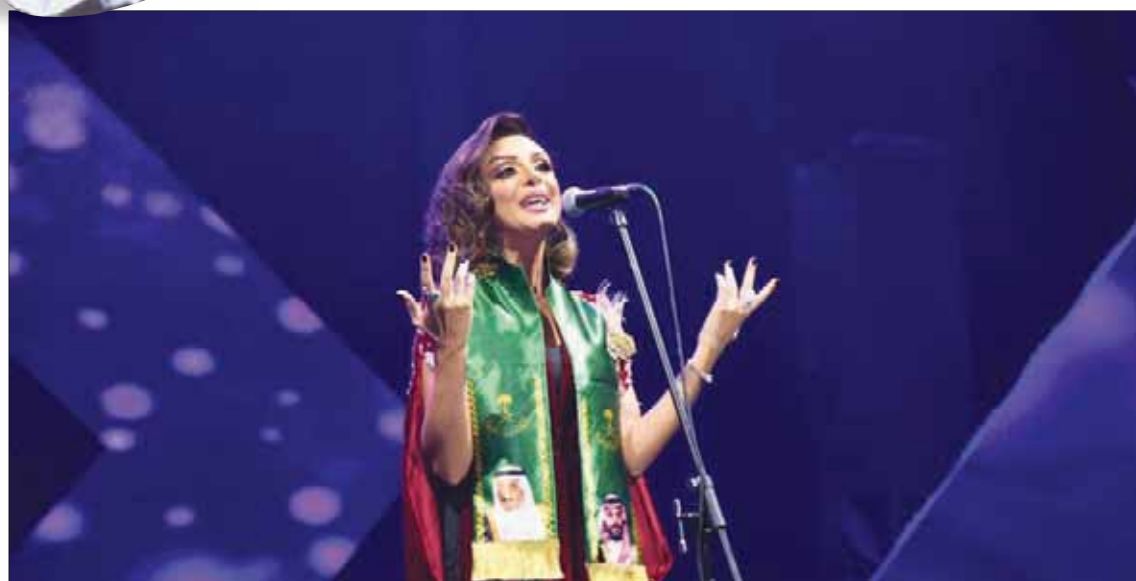
المطربة المصرية أنغام

وكانت الرياض وجدة قد شهدتا حفلين غنائيين أول من أمس، للفنان خالد عبد الرحمن في مركز الملك فهد الثقافي، وبدوره هنا الفنان عبد الله الشامي بالصالة المغطاة، حيث صافحوا جماهيرهم بجملة من الأغاني الوطنية والطربية. شهدت الحفلات مشاركة من جميع فئات المجتمع كباراً وصغاراً حاملين الأعلام السعودية، مرفرفين بها