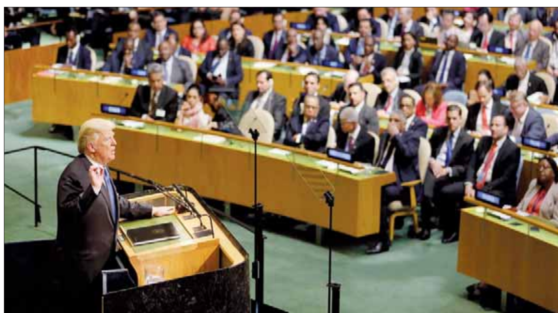
صورة أرشيفية للرئيس ترمب يخاطب الجمعية العامة في 19 سبتمبر من العام الماضي

كذلك، تغفل الوثيقة الأميركية أي ذكر لوكالات الأمم المتحدة الرئيسية التي قدمت مساهمات كبيرة في النقاشات الدائرة حول مكافحة المخدرات على مدى السنوات الماضية، بما في ذلك برنامج الأمم المتحدة الإنمائي وبرنامج الأمم المتحدة المشترك المعني بفيروس العوز المناعي المكتسب (الإيدز)، وهيئة الأمم المتحدة للمرأة والمفوضية السامية لحقوق الإنسان التي نشرت تقريرها الثاني عن المخدرات وحقوق الإنسان، وهذا مثير للمشكلات لأن إدارة ترمب أعلنت انسحاب الولايات المتحدة من مجلس الأمم المتحدة لحقوق الإنسان في يونيو (حزيران) الماضي. ويوحى البعد المتعلق