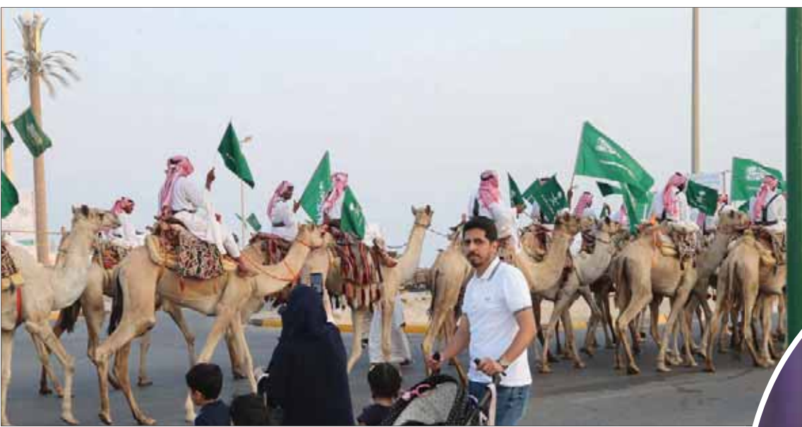
من فعاليات اليوم الوطني السعودي