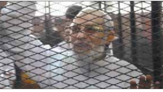
بديع خلف القضبان (الشرق الأوسط)

أخريين بالسجن المشد 10 سنوات، و22 متهمًا بالمشد 3 سنوات، ومتهمًا واحداً بالسجن 15 سنة، وبتهمًا أخر بالسجن 3 سنوات، وبالحبس مع الشغل لمدة سنتين و22 متهمًا. كما قررت المحكمة معاينة 21 متهمًا بالسجن المشد 5 سنوات، وبتهمًا خذت بالسجن 10 سنوات، وبتهمًا 463 متهمًا مما نسب إليهم، وانقضاء الدعوى الجنائية المقامة ضد 6 متهمين لوفاتهم، واعتبار الحكم الصادر بإعدام متهمين قائماً، وانعدام المسؤولية الجنائية لنهم واحد بسبب عجزه العقلي، وعدم الاختصاص بالنسبة إلى 4 متهمين أحداث، وأحالتهم إلى النيابة العامة.