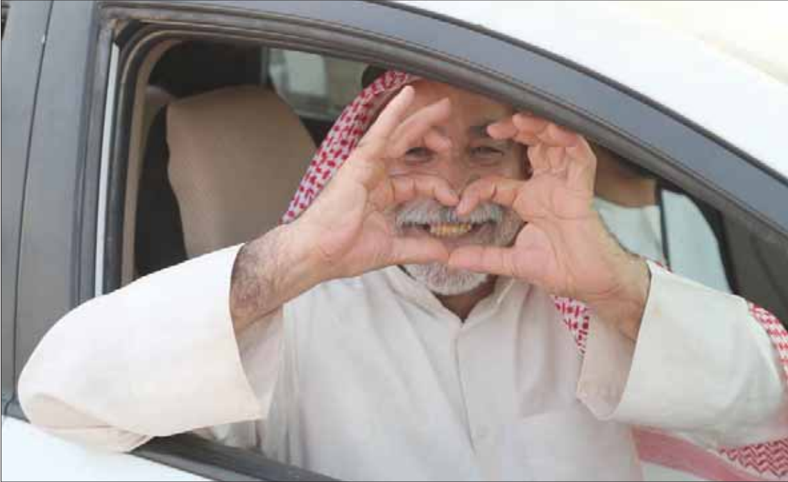
جانب من فعاليات اليوم الوطني من مختلف مناطق السعودية