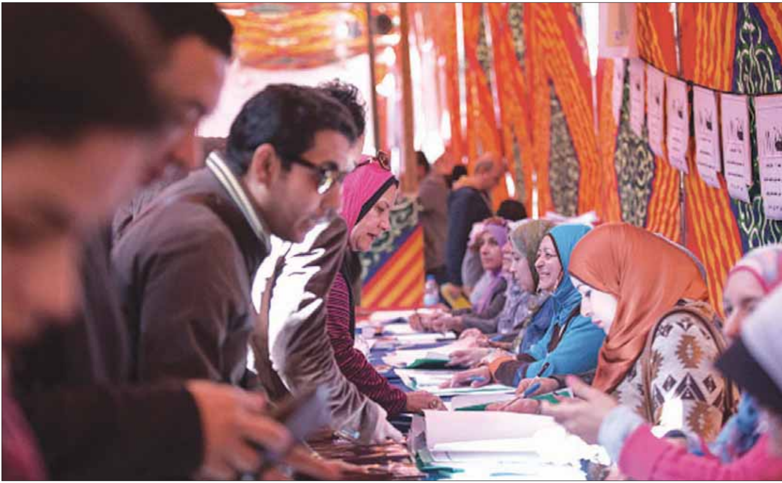
صحافيون مصريون يصوتون في الانتخابات الأخيرة لنقابتهم

من جهته، أكد هيكل «لا بد من إعادة النظر في هذا المقترح قبل تقديمه لمجلس النواب، لأن تطبيقه عملياً مستحيل»، مشيراً إلى أن «عرض المقترح بشكله الحالي على البرلمان يجعل من الصعب تمريره والموافق عليه».