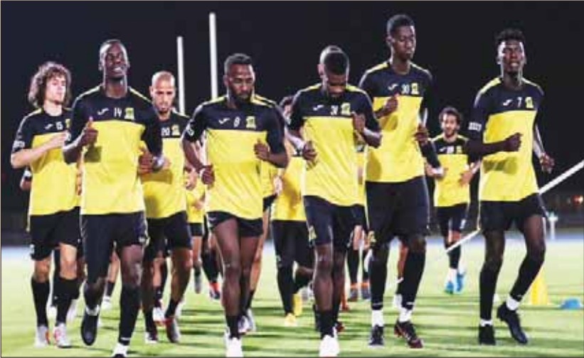
الاتحاديين يأملون أن تحدث التغييرات الإدارية أثراً إيجابياً على نتائج الفريق