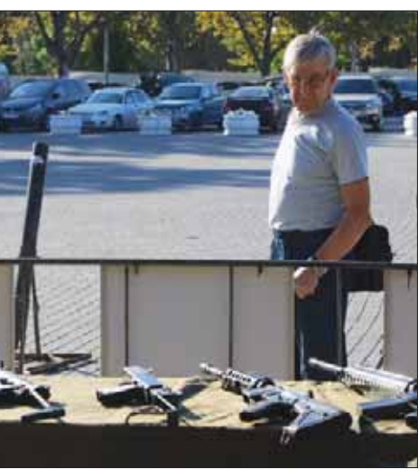
معرض أسلحة في القرم على البحر الأسود تقول روسيا إنها اقتنصتها من فصائل معارضة في سوريا

أخرى بسوريا، وحذرت الأمم المتحدة من أن أي هجوم سبب كارثة إنسانية. وتعد محافظة إدلب آخر أبرز معاقل هيئة تحرير الشام والفصائل المعارضة في سوريا. وتسيطر الهيئة على الجزء الأكبر منها، كما تتواجد فصائل الجبهة الوطنية في مناطق عدة، وتنشط فيها أيضاً مجموعات جهادية أخرى أبرزها تنظيم حراس الدين المرتبط بتنظيم القاعدة والحزب الإسلامي التركيستاني. وبعد أسابيع من التعزيزات العسكرية إلى محيط إدلب، وإثر مفاوضات مكثفة، توصلت روسيا وتركيا قبل أسبوع إلى اتفاق يقضي بإنشاء منطقة عازلة بعمق 15 إلى 20 كيلومتراً على خطوط التماس بين الفصائل وقوات النظام في إدلب.