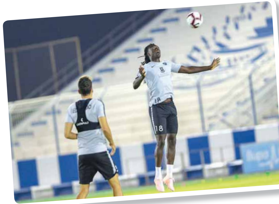
من تدريبات الهلال الأخيرة استعداداً لمواجهة الفتح

عريضاً على الاتحاد بخمسة أهداف مقابل ثلاثة في الجولة الماضية، كأول انتصار للفريق العامة للرياضة، وذلك عقب النتائج غير المرضية التي حققها الفريق مع انطلاق منافسات الموسم الرياضي الجديد، سعياً إلى تصحيح مساره وإعادته إلى جادة الانتصارات. وخاطب تركي آل الشيخ رئيس مجلس إدارة الهيئة العامة للرياضة، الجماهير الاتحادية، بعد موافقته على التعديلات الإدارية في الاتحاد: «قريباً أخبار سارة بخصوص مدرب عالمي ولاعبين عالميين للتعديلات القادمة، ووجه المقربين رسالة للجماهير الاتحادية، التي وصفها بالعزيمة، بقوله: «أما زلنا نعمل من أجلكم، وأماناً معكم لا حدود لها، كونوا مع ناديتكم، وأرجو قبولكم دعوتي لحضور مباراة الأربعا أمام شقيقنا الوحدة؛ دعماً لناديتكم الكبير، وتقبلاً لمساهمتي بكامل تذاكر المدرج».