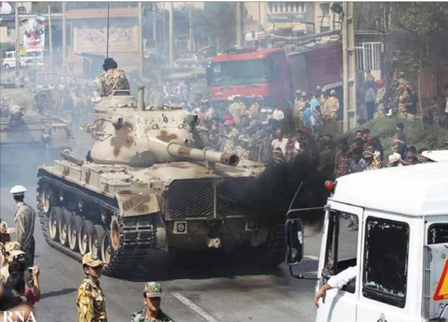
دبابة «إم 47» من القوات البرية التابعة لـ«فيلق 92» بالجيش الإيراني ضمن رتل دبابات دخل إلى حي سكني في الأحواز (أرنا)

وكان من المفترض أن يسحب «الحرس الثوري» بدوره نتيجة المطالب الشعبية بتخفيف التواجد العسكري والمظاهر العسكرية في المدينة. وتحولت قضية القواعد العسكرية وما تشكله من مخاطر على الأحياء السكنية إلى قضية رأى عام رآه عليها المتنافسون في انتخابات البرلمان ومجالس البلديات.