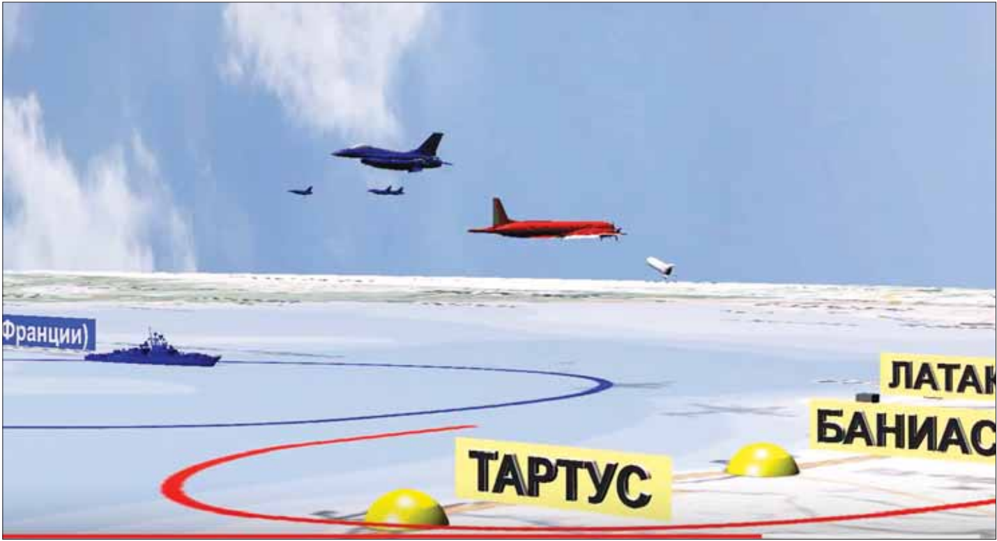
صورة توضيحية عبر الكمبيوتر نشرتها وزارة الدفاع الروسية أمس تبين قرب الطائرة الإسرائيلية (بالأزرق) من طائرتها (بالأحمر) أمام الشواطئ السورية

الإسرائيلي برتبة ملازم أول: تسلمت المعلومة وسأوصلها للقيادة». وزاد أنه في الساعة 22:40 غادرت مقاتلات (إف16) هذه المنطقة. وبعد نحو ربع ساعة على ذلك تلقت القيادة الروسية إشارة إسرائيلية تفيد بأن معلوماتكم حول إصابة طائرة روسية وصلت، وقمنا بتنظيف المكان».