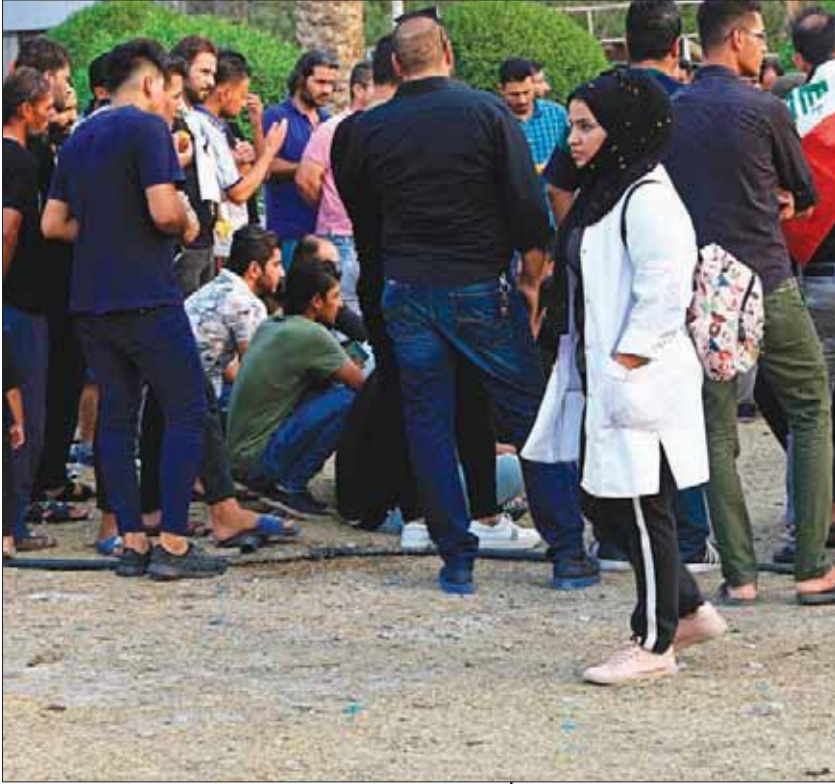
مسعفة وناشطة عراقية تساند المظاهرين في البصرة تعرضت للضرب والتهديد (أ.ب)