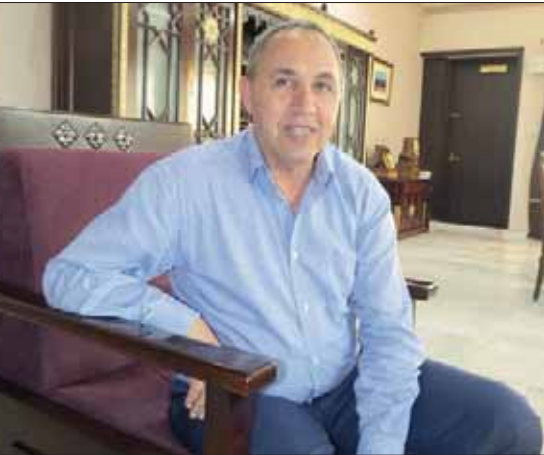
وزير الثقافة الجزائري عز الدين ميهوبي

ليس هناك اعتراض على الفيلم لكن بعض الناس فهموا أن التعاقد مع فنان عالمي مثل جيران دو بارديو أمر سيئ بالعمل، وهو صاحب باع طويل أكثر من 50 عاماً في الحضور والتأثير في المخيلة السينمائية العالمية. نحن لا نخشى من الأعمال الفنية وتوظيف الماضي فنان له حياته الخاصة وهو