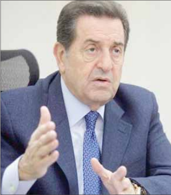
النائب والوزير السابق بطرس حرب

بيروت، يوسف دياب رأى النائب والوزير السابق بطرس حرب، أن الأزمة السياسية التي يعيشها لبنان لا تتوقف عند الخلاف على توزيع الحصص داخل الحكومة العتيدة، بقدر ما تتصل بمعركة الانتخابات الرئاسية المقبلة. واستغرب كيف أن «أقرب المقربين من رئيس الجمهورية ميشال عون يسعون لوراثة وهو لا يزال في بداية عهده»، معتبراً أن «التنترقا الوطني الحزب ومنذ كان عون رئيساً له، اعتمد أسلوب تعطيل الاستحقاقات الدستورية، عندما لا تصب هذه الاستحقاقات في مصلحته، ولا يزال مستمراً في هذا الأسلوب». ولفت إلى أن ثبات الاستقرار الأمني في لبنان، أو انفلاته، يبقى رهن إرادة من يمتلك فائض القوة العسكرية (حزب الله)، والذي أطلق في الأونة الأخيرة تحديراً بعنوان «لا تلعبوا بالنار». وفي حديث مع «الشرق الأوسط»، تناول حرب بالتفصيل