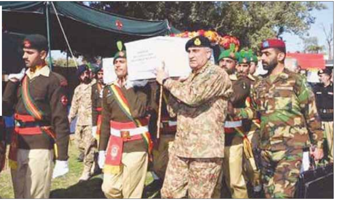
قائد الجيش الباكستاني يشارك في تشييع الجنود القتلى خلال عملية أمنية ضد مخاين للمسلحين في إقليم وزيرستان الشمالية... وفي الإطار صورة لضابط بين القتلى

كان يوجد فيها 350 من أفراد القوات الحكومية، حيث عانوا من إصابات جراء القصف المتواصل من قوات «طالبان». ولقي ثلاثة ضباط من القوات الأفغانية مصرعهم بعد استهدافهم في مدينة بولي علم مركز ولاية لوغر، كما لقي مدنيان مصرعهما في مديرية المدينة نفسها مصرعهم وأصيب ثلاثة آخرون، إضافة إلى إصابة ومقتل ضابط استخبارات. وكان مقاتلو «طالبان» هاجموا مركز مديرية خوشي ومقر الشرطة والاستخبارات الأفغانية فيها، دون ذكر تفاصيل نتائج الهجوم. من جانبها أعلنت السلطات المحلية في إقليم نجرهار شرق أفغانستان أن القوات الأفغانية