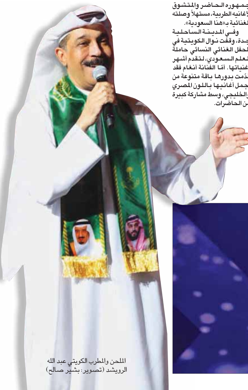
المحّن والمطرب الكويتي عبد الله الرويشد

مع كل أغنية وطنية، وتابع مجرياتها جمهور عريض عبر شاشات التلفزة، وُرصدت فعاليات على مواقع التواصل الاجتماعي، وقد نظمت بدعم من الهيئة العامة للثقافة «اللجنة الفنية»، وبإشراف من تركي آل الشيخ رئيس اللجنة الفنية، وتنظيم من «روتانا للصوتيات والمرئيات».