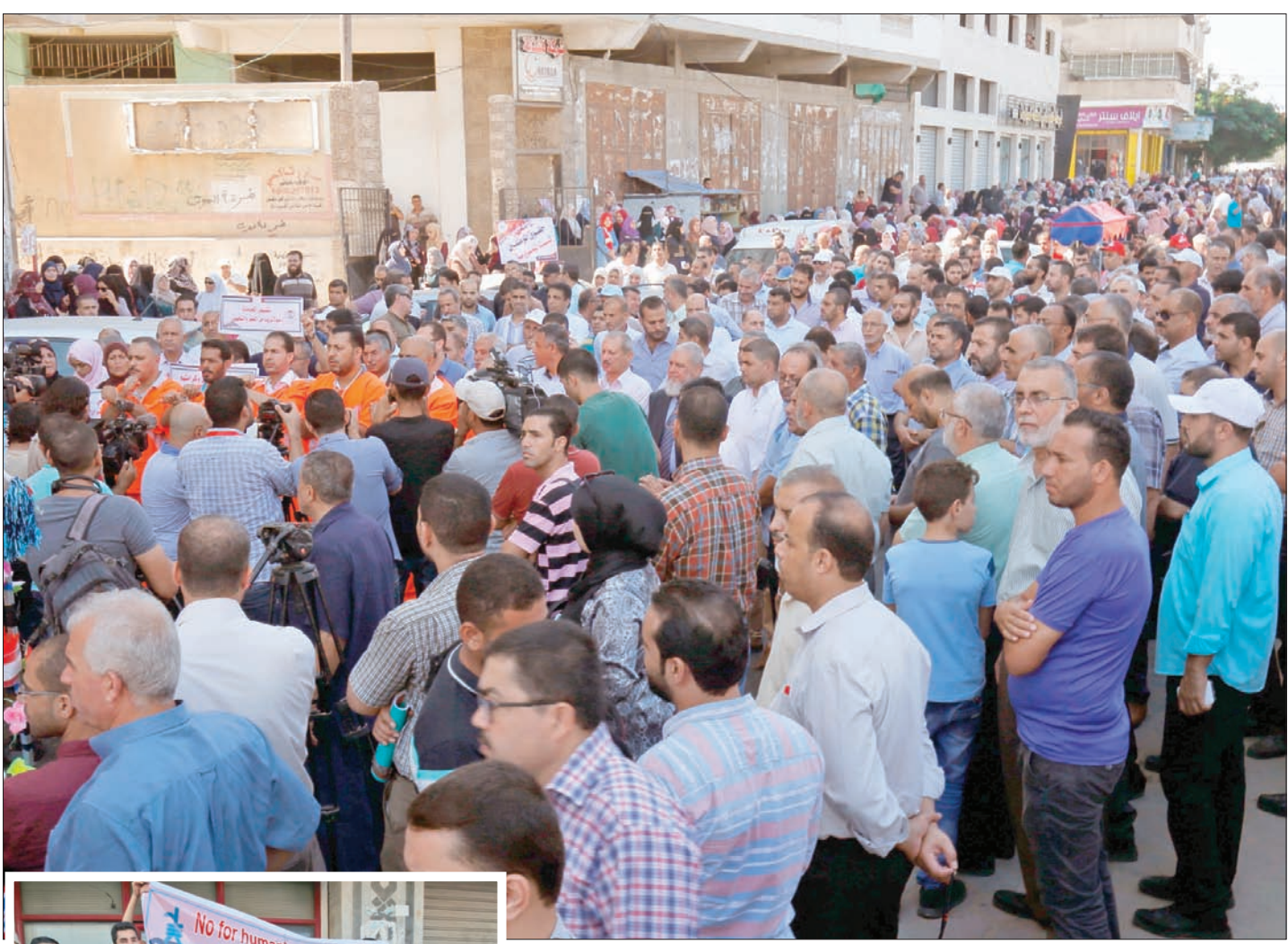
جانب من مظاهرة موظفي «أونروا» الاحتجاجية في مدينة غزة أمس

شارك نحو 13 ألفاً من الموظفين التابعين لوكالة غوث وتشغيل اللاجئين الفلسطينيين (أونروا)، أمس (الأربعاء)؛ احتجاجاً على سياسات إدارة المنظمة الأممية، وتكرها لحقوقهم، والتقليص المتواصل لخدماتها المقدمة للاجئين في قطاع غزة. ورفع المتظاهرون لافتات ترفض المساومة على أن حقوق الموظفين واللاجئين، وتطالب بضمان حياة كريمة لهم، معتبرين ما يجري من تقليصات وفصل للموظفين «جريمة»، وإمعاناً في «الحرب» بضع اللاجئين. داعين المنظمة إلى تطبيق القرارات الدولية المتعلقة بهم دون التنازل عن حق العودة. وارتدى نحو 10 من الموظفين «زي الإعدام»، ورفعوا باخطة كتب عليها «لا لإعدام الإنسان يا أونروا... الجدار الأخير»، معتبرين ما يجري من تقليصات شاملة، حالة «إعدام» للاجئين الفلسطينيين، ضمن مخطط لتصفية القضية بذرائع مالية واهية.