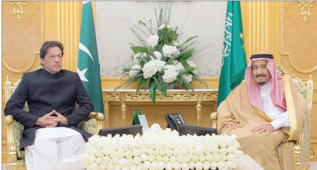
خادم الحرمين الشريفين ورئيس الوزراء الباكستاني خلال جلسة المباحثات التي تناولت علاقات البلدين والأوضاع في المنطقة