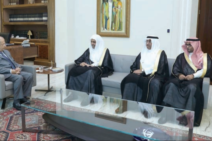
الأمين العام لرابطة التعاون الإسلامي محمد بن عبد الكريم العيسى والوفد المرافق التقى الرئيس ميشال عون أمس (الداخلي ونهرا)

بمستقبل لبنان، وتحمل طموحاً وهمة عالية وصادقة»، مؤكداً أن «مستقبل لبنان يبشر بالخير»، ورأى أن «الحالة التي سببت بعض المتاعب هي حالة عرضية ووعكة