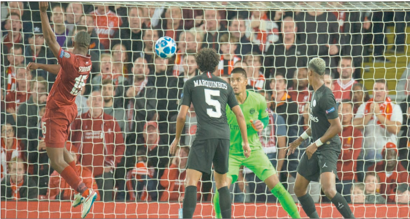
ستورديج مهاجم ليفربول (يسار) يسجل برأسه في مرمى سان جيرمان