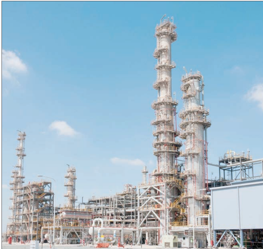
تهدف وحدة الرويس لتلبية الطلب العالمي المتزايد على منتجات البولييمر المتخصصة

وأوضح جاسم الصايغ الرئيس التنفيذي لـ «أدنوك للتكرير»: «تمثل وحدة نزع الهيدروجين من البرولين لإنتاج البرولين إحدى المراكز الأساسية لاستراتيجية أدنوك للتكرير للتوسع في عملياتها بهدف المساهمة في تحقيق أقصى قيمة من أعمال أدنوك في مجال التكرير والبتروكيماويات، إضافة إلى ذلك يؤكد تشغيل هذه الوحدة