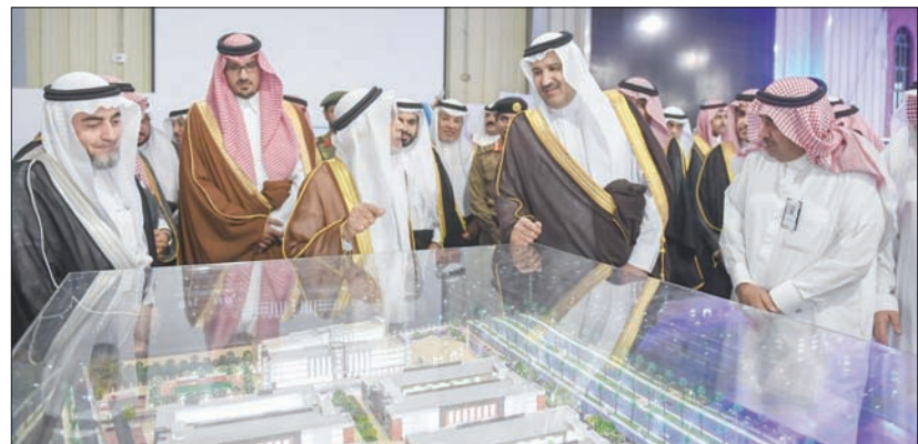
الأمير فيصل بن سلمان لدى افتتاحه فعاليات «ملتقى ومعرض التوطين والتوظيف»

تحت شعار «التوطين... شراكة والزام»، لمدة ثلاثة أيام، بمشاركة كثير من الجهات من القطاعات الحكومية والخاص. كما دشن أمير المدينة المنورة منصة التوطين الإلكترونية، التي تهدف إلى خدمة المنشآت لرفع الوظائف وجمع الوظائف الشاغرة، وإمكانية عرض الوظائف الموسمية والتطوعية بالمنطقة، إضافة إلى جميع الأخبار والقرارات الحكومية الخاصة بالتوطين، وبيانات الباحثين عن العمل. إلى ذلك، ذكر مدير بن سعد، رئيس مجلس إدارة الغرفة التجارية الصناعية بالمدينة المنورة، أن الملتقى يأتي بشراكة فاعلة بين القطاع الحكومي والقطاع الخاص، بهدف تلبية الصعوبات والتحديات التي تواجه التوطين، وإيجاد قنوات اتصال مباشرة بين راغبي العمل