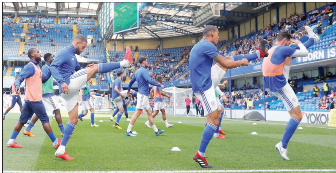
تشيلسي متصدر الدوري الإنجليزي يستهل مشواره في الدوري الأوروبي ببقاء باوك اليوناني

قبل إلغاء المسابقة. ويطمح ميلان في استكمال باقة ألقابه الأوروبية من خلال الفوز بلقبه الأول في الدوري الأوروبي. وقال ماتيا كالدازا مدير مبيعات ميلان: «اللعبة في البطولات الأوروبية شيء خاص دائماً... الإيقاع يختلف عن مباريات الدوري الإيطالي التي تقسم بالناحية الخططية بشكل أكبر». وفي المجموعة نفسها، يلتقي أولمبياكوس اليوناني وريال بيتيس الإسباني. واستمتع برشلونة الموسم الماضي بمشوار رائع نحو النهائي قبل سقوطه أمام أتليتكو مدريد الإسباني. لكن تصرفات بعض جماهيره في تلك الألفية في ليون ستجبر لاعبي المدرب رودري غارسيا على مواجهة أبتراخت فرانكفورت الألماني ضمن المجموعة الثامنة خلف أبواب موصدة. ويعد مرسلينا من الأندية القوية على ملعبه فيلودروم، بيد أن غياب جماهيره قد يعرضه لمخاطر خطيرة أمام حامل لقب كأس ألمانيا الموسم الماضي. وضمن المجموعة نفسها يلعب لاتسيو الإيطالي مع أبولون ليماسول القبرصي. ويتطلع إسبيلية الإسباني إلى تعزيز رقمه القياسي في عدد مرات الفوز بلقب مسابقة الدوري الأوروبي (5 ألقاب). ويخوض الفريق فعاليات هذه