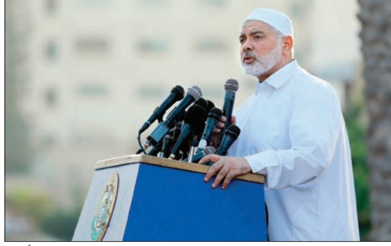
رئيس المكتب السياسي لحماس، إسماعيل هنية يلقى خطاباً في عيد الأضحى الماضي

مباحثات التهديد في هذا الوقت، لكن عضو المكتب السياسي لحركة الجهاد الإسلامي في فلسطين، نافذ عزّام، قال إن مباحثات «التهديد» في قطاع غزة مع الاحتلال لم تنقطع. مؤكداً أن «الفصائل كانت قريبة جداً من توقيع اتفاق قبل أن تعيقه السلطة. وأضاف: «في الحقيقة كنا على مسافة قريبة جداً من التوصل لاتفاق تهدئة (قبل عيد الأضحى)، يخفف جزءاً من معاناة شعبنا، دون أن ندفع ثمنًا سياسياً، لكن السلطة الفلسطينية أعاقته، والبروات المطروحة من جانبها في هذا الإطار غير مقبولة، وغير منطقية».