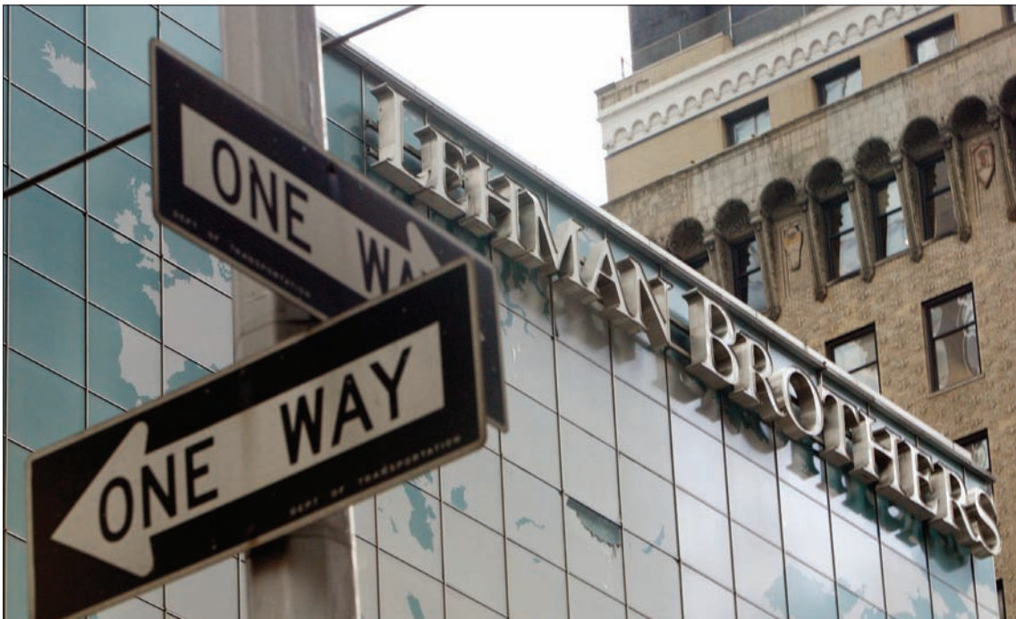
بعد عشر سنوات لا تزال ظلال الأزمة التي بدأت بانهيار بنك ليمان برادرن تهيم على العالم

الاحتياطي البنكي عدة مرات هذا العام في محاولة لدعم السيولة للشركات الصغيرة والمتوسطة الحجم، كما ساعد ضعف اليوان الصيني الخاضع للسيطرة والإعتماد على الصادرات في تعويض الكثير من التآخير الفوري لعدم اليقين التجاري على الاقتصاد الصيني.