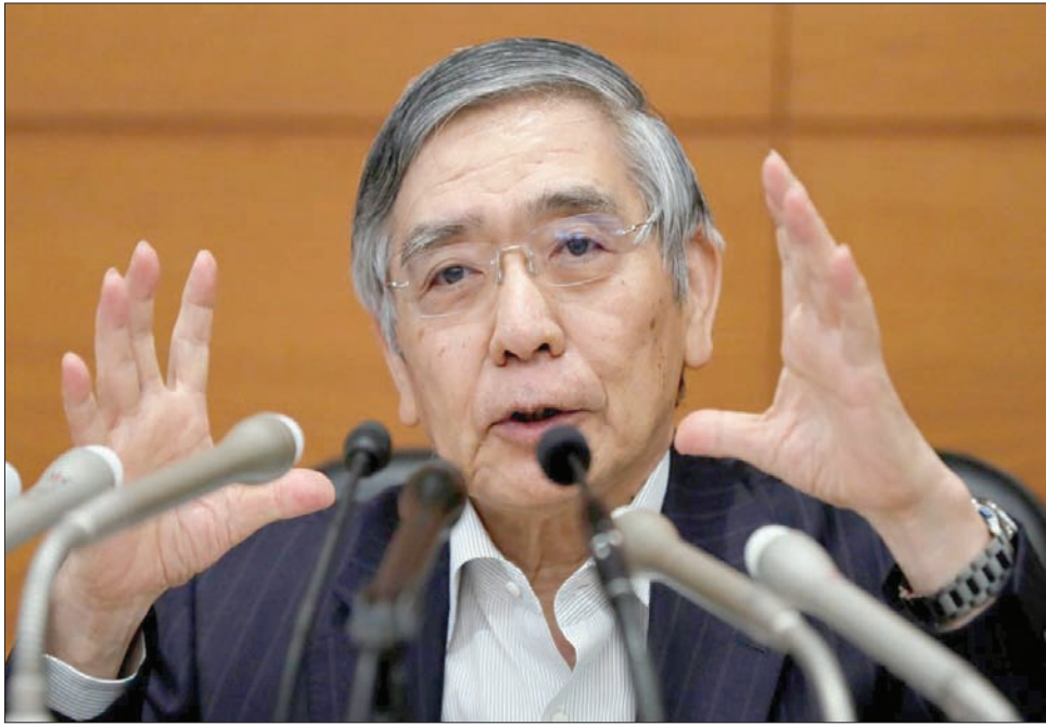
حاكم المصرف الياباني هاروهيكو كورودا يتحدث في مؤتمر صحفي أمس عن سياسة بلاده النقدية

وتراجعت صادرات السيارات إلى الولايات المتحدة لثالث شهر على التوالي مقارنة مع انتعاش قوي للشحنات في العام الماضي. غير أن البيانات التجارية أظهرت أن الواردات من الولايات المتحدة زادت 21,5 في المائة في أغسطس، وجاءت