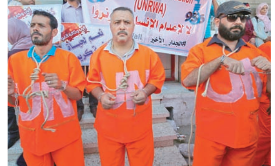
موظفون في «أونروا» ظهروا خلال المظاهرات بملابس الإعدام وأيديهم مكبلة بالأسلاك

المعروف أن مساحة ما صار يسمى «أراضي الدولة» في الضفة الغربية، وفقاً للأنظمة الإسرائيلية، تبلغ 1,4 مليون دونم، في المنطقة «ج» وحدها (وهي المنطقة التي بقيت تحت السيطرة الإسرائيلية الكاملة وفقاً لاتفاقيات أوسلو قبل 25 سنة). وقالت حركة «سلام الآن»، في تقريرها تعقيباً على هذا التقسيم: «إسرائيل تخصص الأراضي لليهود بشكل منهجي، ضمن سياسة لا يمكن تسميتها سوى أبرتهايد. وهناك أبعاد قيمة وإستراتيجية لهذه السياسة، إذ إن الأرض تعتبر من أهم الموارد المعيشية، وتفضيل شعب على حساب شعب آخر هو من أهم سمات الأبرتهايد، خصوصاً أن 88 في المائة من المواطنين في الضفة هم فلسطينيون (2,935,365 نسمة)، مقابل 12,3 في المائة مستوطنون يهود (399 ألفاً و300 مستوطن فلسطيني في القدس الشرقية المحتلة)».