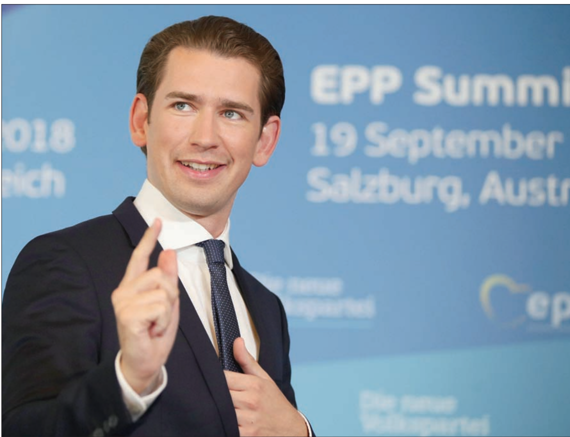
المستشار سيباستيان كورز الذي يقود التحالف اليميني في النمسا يستضيف القمة الأوروبية

وتشدد هذه الأوساط على أنه بات من المؤكد اليوم أن البريكسيت، أياً كان الاتفاق الذي سيتم على أساسه، سيلحق ضرراً أكدياً بالائتلاف البريطاني مع انخفاض إجمالي الناتج القومي، وبالاكتسيات الاجتماعية التي ستجرح عظمها، فضلاً عن أنه قد يشكل خطراً على الوحدة إذا تعذر التوصل إلى حل مرضي بالنسبة لحدود أيرلندا الشمالية.