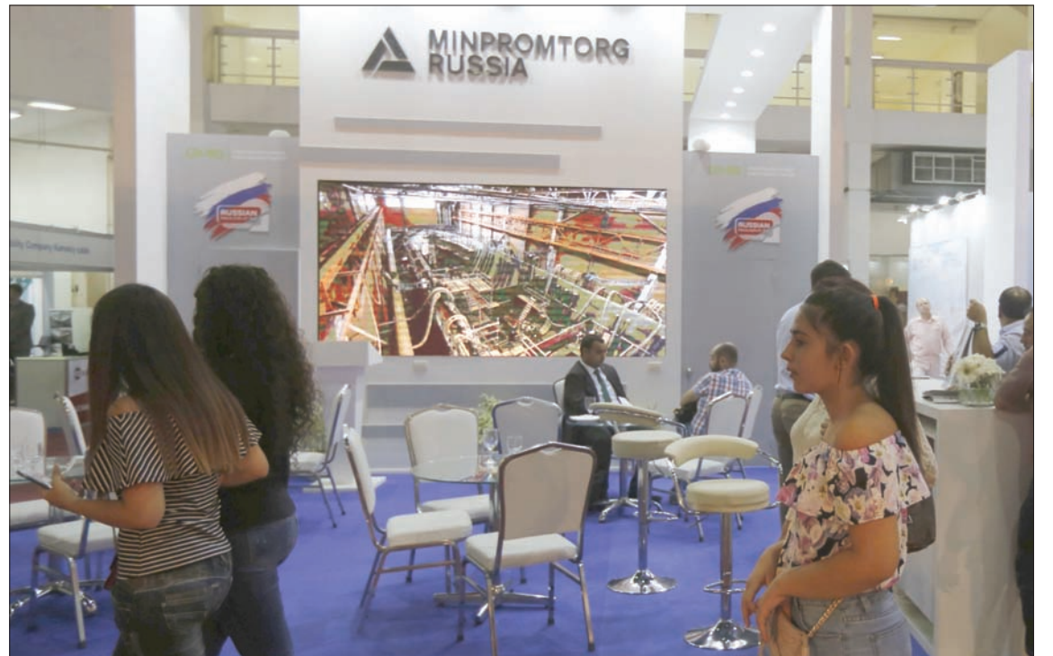
زوار امام جناح الشركات الروسية في معرض دمشق الدولي