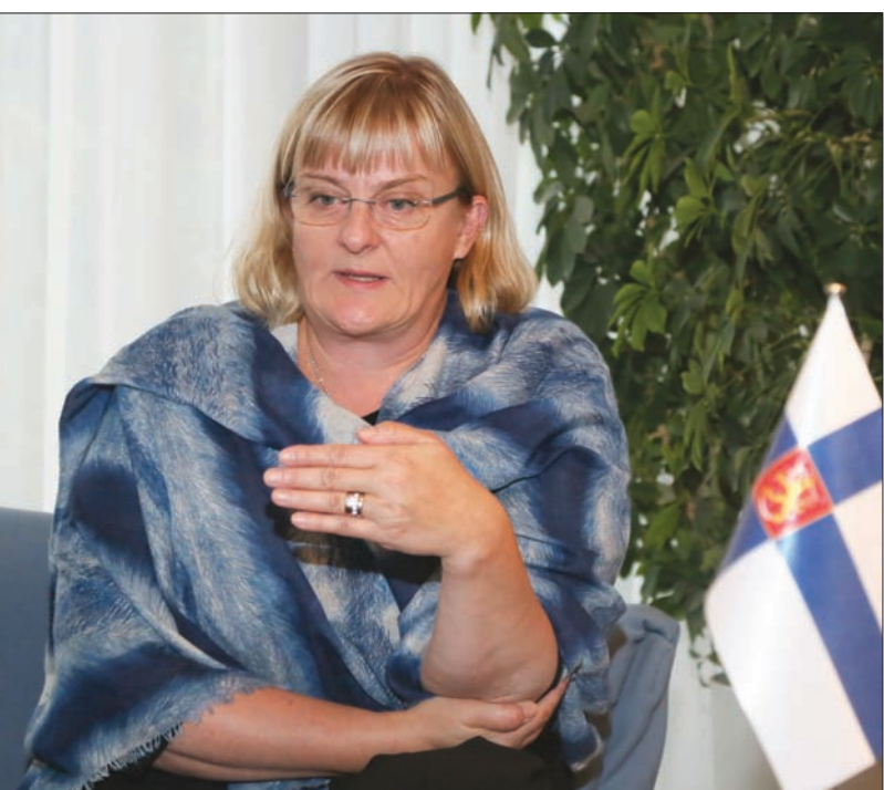
بيركو ماتيليا وزيرة الصحة والشؤون الاجتماعية الفنلندية

وأضاف «بعد زيارتنا هذه أصبحنا على قناعة تامة بحجم الفرص المتاحة أمام شركات البلدين للمشاركة والمساهمة في تحقيق رؤية 2030 وتطوير خدمات الرعاية الصحية، نحن ملتزمون بتوفير التكنولوجيا المتقدمة في هذا المجال، لا سيما تشخيص الأمراض وعلاجها، نسعى للتعاون مع القطاعين العام والخاص السعودي، وهناك شركات فنلندية لديها مناشآت متقدمة مع شركات سعودية خاصة وحكومية في المجال الصحي».