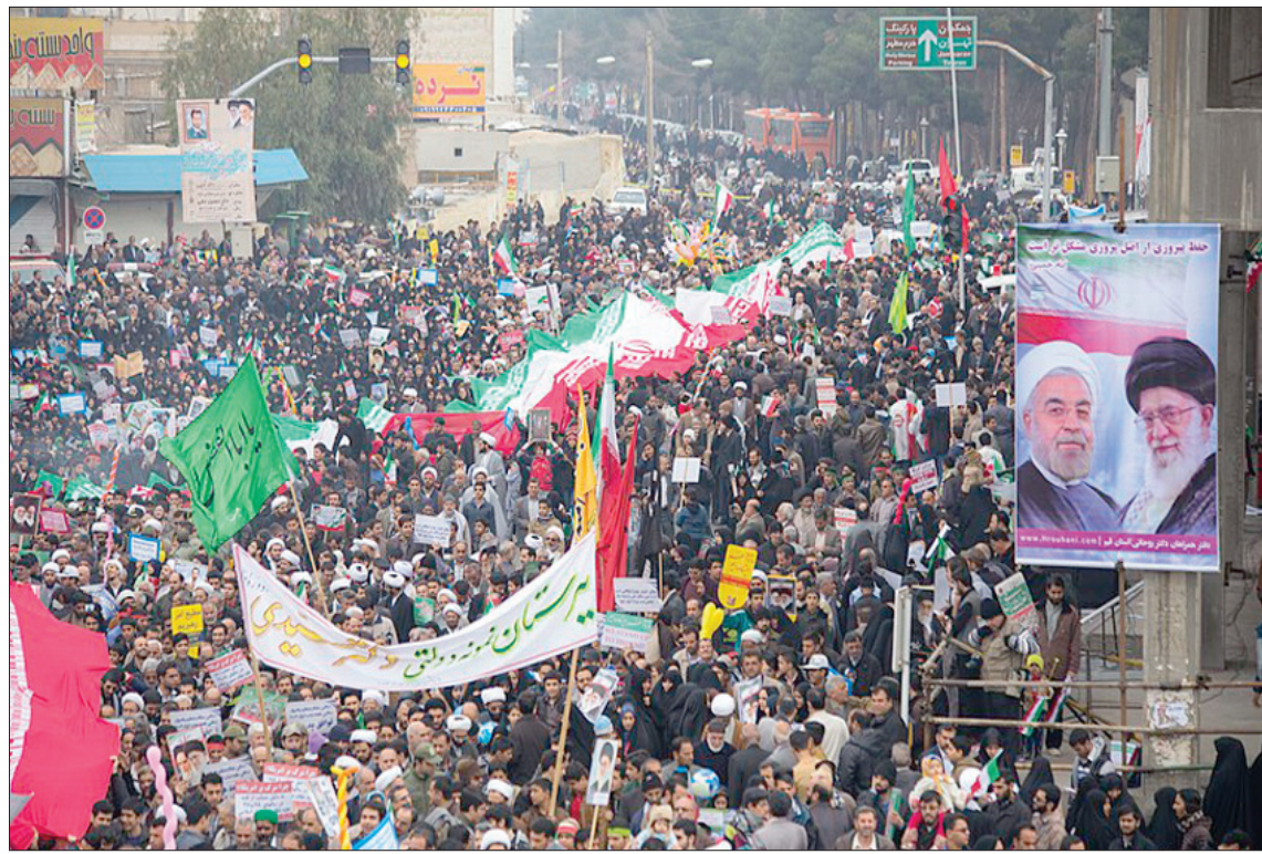
أدرك النظام الإيراني بعد الثورة أن شرعيته تنأت بالتمايز القومي والعربي ومن ثمّ دمج بين الإيرانية والشيعية

وعلى صعيد الأدب والفكر برز على السطح مجموعة من المفكرين والأبناء حملوا لواء التنظير الهوياتي الفارسي، وكان من أبرزهم المؤرخ عبد الحسين زرين كوب (1923 - 1999م)، من أعماله: «احتلال العربي لإيران و«القرنان من الصمت»، بل «لا شرقي ولا غربي... بل إنساني».