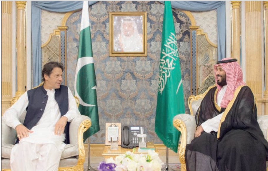
الأمير محمد بن سلمان ولي العهد السعودي لدى لقائه رئيس الوزراء الباكستاني (واس)