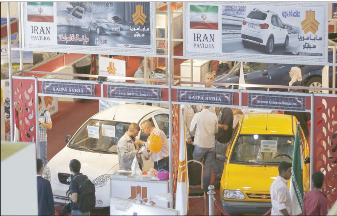
... وجناح الشركات الإيرانية