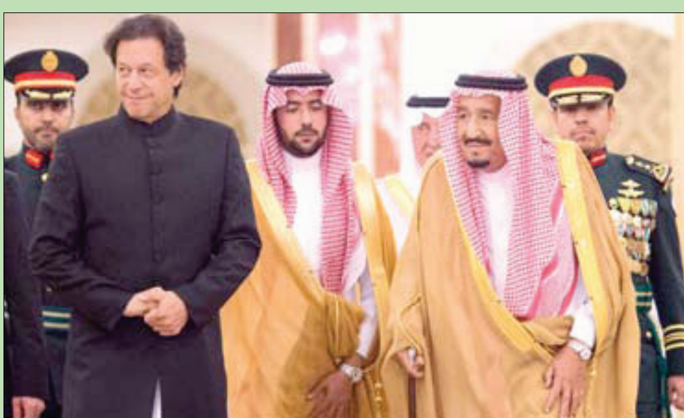
الملك سلمان لدى ترحيبه برئيس الوزراء الباكستاني في جدة أمس

جدة، «الشرق الأوسط» عقد خادم الحرمين الشريفين الملك سلمان بن عبد العزيز في قصر السلام بجدة، أمس، جلسة مباحثات مع رئيس الوزراء الباكستاني عمران خان، استعرضت متانة العلاقات بين البلدين وبحث المستجدات الإقليمية. كما التقى الأمير محمد بن سلمان بن عبد العزيز ولي العهد نائب رئيس مجلس الوزراء وزير الدفاع، ورئيس الوزراء الباكستاني، وتناول الجانبان العلاقات بين البلدين والأوضاع الإقليمية. وأكد عمران خان في مقابلة مع قناة «العربية»، ثبت الأحد المقبل، أن بلاده تقف إلى جانب السعودية دائماً، وأن أي شخص يتولى السلطة في باكستان تكون المملكة وجهته الأولى. وقال إن السعودية ساعدت باكستان عندما احتاجت إلى المساعدة. واجتمع عمران خان أيضاً في جدة مع الأمين العام لمنظمة التعاون الإسلامي الدكتور يوسف العثيمين الذي شدد على موقف المنظمة الثابت إزاء دعم باكستان، وتأييد مطالعها المتعلقة بإقليم جامو وكشمير. ولفت العثيمين إلى أن زيارة عمران خان إلى السعودية سيكون لها أثر إيجابي كبير على العمل الإسلامي المشترك. (تفاصيل ص 2)