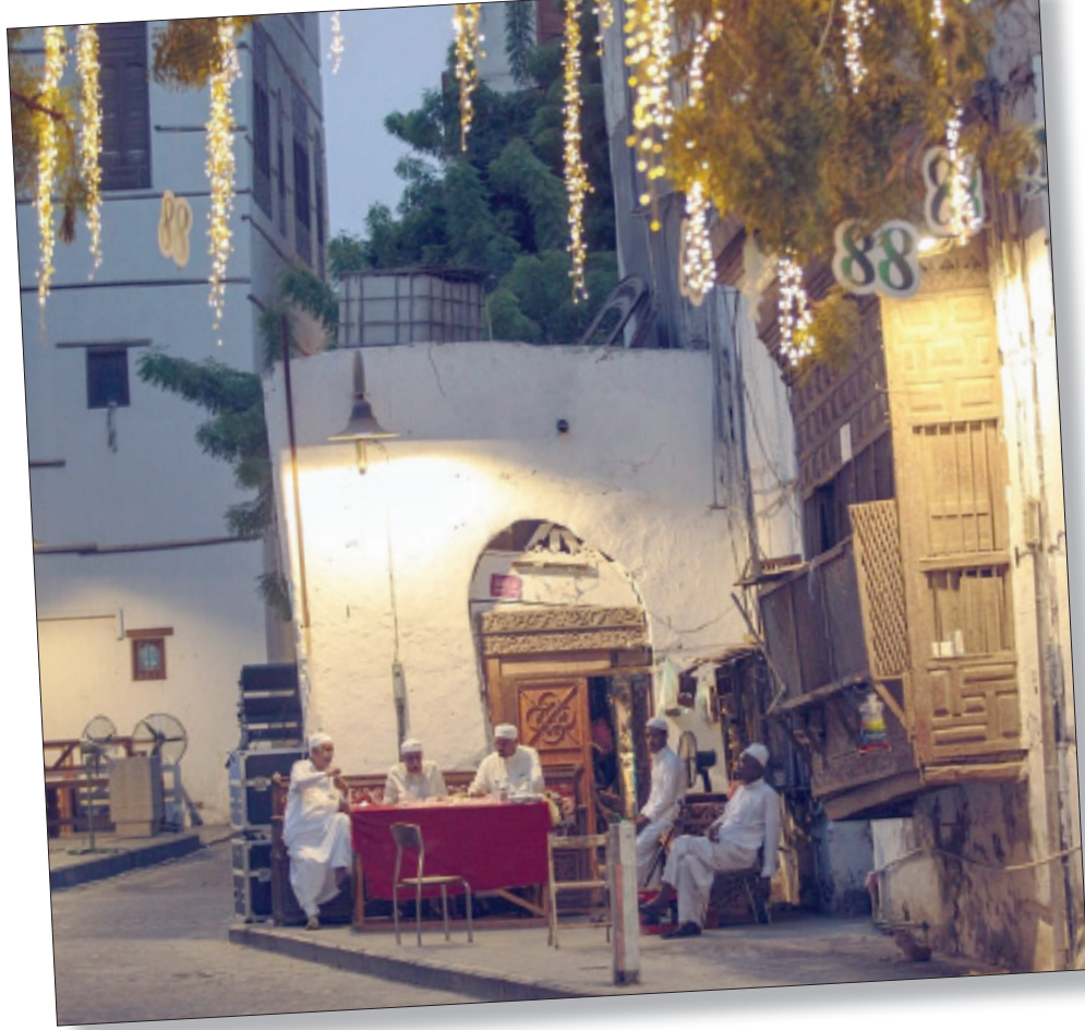
تاريخية جدة تستعد للاحتفاء باليوم الوطني للمملكة «بحارة زمان» التي تجسد المدينة قبل 80 عاماً

وتقدم جاكسون للحصول على جائزة الإيمي، وهي الجائزة التلفزيونية الشهيرة للأفلام التسجيلية، وقد وجدت لجنة التحكيم أن الجائزة مستحقة، وأني أيضاً أستحق الجائزة، ولا أنسى عندما أرسلت الجائزة لي ولم أتوقع ذلك إطلاقاً، ولذلك اعتقد أنني الوحيد من خارج وسط المخرجين والمخرجين الذين حصلوا على جائزة الإيمي أعلى جائزة في التلفزيون الأميركي، ولذلك أضع هذه الجائزة داخل مكتبي وأعزتها بها جداً. وبعد ذلك فكرت في أن هناك ضرورة لكي أقوم بالحفر داخل هذا النفق، وقد فكرت طويلاً في هذا الموضوع، لأنني كنت أعلم أن هناك خطورة على المقبرة، لأن إزالة الرديم من النفق قد ينسب بانهايار المقبرة تماماً؛ لذلك كان لا بد من دراسة الناحية الجيولوجية لصخر المقبرة، بالإضافة إلى إيجاد طريقة لسند سقف النفق، وخصوصاً لأن مدخل النفق مسنود بالأخشاب وهي ليست كافية لإطلاقاً لحماية المقبرة أثناء الحفائر، وقررت أن نبداً الحفائر، وتكشف عن سر مقبرة الملك سيتي الأول.