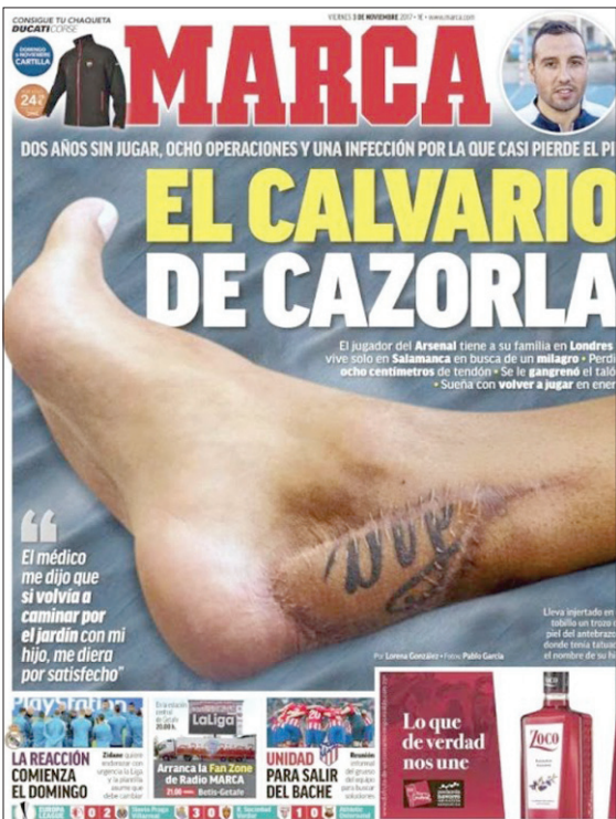
الصحافة الإسبانية عندما أدركت مدى إصابة كازورلا

حدث في مباراة تشيلي. يقول كازورلا: «أنا لا ألوم نفسي، لكن يجب الاعتراف بانني تعرضت للإصابة في الدقيقة 20 ولعبت المباراة كاملة وأنا مصاب. إنني أقول لنفسي في بعض الأحيان وكيف يحدث ذلك. يمكنني أن أطلب الخروج من الملعب. لقد سألتني المسؤولون في أرسنال عما الأسباب التي جعلتني لا أطلب التغيير، لكنني أحترم قراره على أي حال. وعندما ظهرت الإصابة، كان يتعين علي أن أتوقف عن المشاركة في المباريات لكنني وضعت ضمانة على قديمي وشاركت في المباريات الأسبوع التالي».