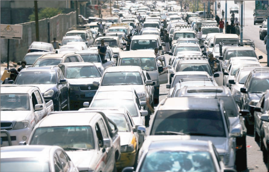
طوابير السيارات في انتظار الوقود كما بدت في صنعاء أمس

وقال رئيس اللجنة الاقتصادية اليمنية إن البنك اتخذ هذه التدابير «بموجب مسؤولياته القانونية ومنها أهمية الحفاظ على الاستقرار الاقتصادي في ظل الظروف الصعبة والمعقدة»، مؤكداً أن حماية الاستقرار الاقتصادي مسؤولية جمعية من الحكومة إلى الشعب وجميع شرائح المجتمع كون الأضرار الاقتصادية