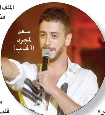
سعد لمجرد

الرباط - باريس، «الشرق الأوسط» من جديد، عاد المطرب المغربي الشاب سعد لمجرد إلى السجن؛ تنفيذاً لمقتضيات قرار أصدره قاضي الحريات في مدينة «إيكس أون بروفانس» جنوبي فرنسا، الثلاثاء، للتحقيق معه حول تورطه في شبعة الاعتصام الثانية، عقب شكوى تقدمت بها عاملة موسمية في الثامنة والعشرين من عمرها ضده أثناء قضائه جزءاً من عطلته في منطقة سانت تروبيه الساحلية. وقبل صدور هذا القرار، ترددت أخبار عن لمجرد، نقلاً عن مصادر مقربة منه، بكونه يجتاز أزمة نفسية صعبة، نتيجة تدهور معنوياته، جعلته ينقطع فترة من الوقت عن استعمال وسائل التواصل الاجتماعي. ومما زاد في إحساسه بالخيبة، حسب المصادر نفسها، أن المحامي الفرنسي إريك دوبيون موريتي، الملقب «الووش»، قرر التخلي عنه، فور علمه بتورطه في قضية الاعتصام الثانية، وتولى الدفاع عنه محام فرنسي هو جان مارك فديدا. وكان لمجرد قد أدى كفالة مالية بمبلغ مائة وخمسين ألف يورو من أجل الإفراج عنه، وقد فرضت عليه العدالة الفرنسية تسليم جواز سفره لسلطات الأمن، وعدم مغادرة التراب الفرنسي، في انتظار الحسم في القضية. وحسب الأصدقاء المتداولة في الصحافة الفرنسية، فإن لورا بريول، صديقة في أول قضية اغتصاب بفرنسا، عجزت عن شعورها بالسعادة؛ كون لمجرد عاد إلى الزنزانة، وهي التي لطالما اشتكت في مختلف وسائل الإعلام من بطء النظر في