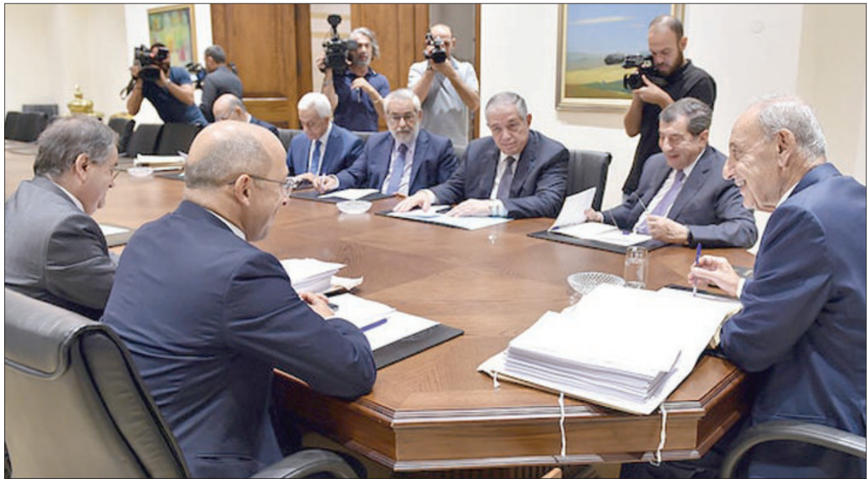
رئيس مجلس النواب نبيه بري ترأس اجتماعاً لهيئة مكتب المجلس أمس

تمتحنى على رئيس مجلس النواب، أن «يعيد النظر في توجهه، ويمتنع عن دعوة المجلس النيابي إلى الانعقاد»، ودعا في تصريح له إلى «تحميل الأطراف السياسيين المتنازعين على مقاعد السلطة والطامعين بالسيطرة على الحكم، مسؤولية مواجهة شعبهم وحاجاتهم، وتخفيف شروطهم ومطامعهم، واعتبار مصلحة لبنان واللبنانيين أهم وفوق كل مصالحهم الفئوية والحزبية والشخصية»، ورأى أنه «من غير الجائز ذبح البلاد وتدميرها لتحقيق مكاسبهم وأحلامهم ببلوغ السلطة»، وقال في لعبتهم الشعبية في أعينهم: «رغم جواز الجلسة التشريعية استناداً إلى الفقرة الثالثة من المادة (69) من الدستور، التي تنص على أنه (عند استقالة الحكومة أو اعتبارها مستقيلة، يعقد مجلس النواب حكماً، حتى تشكل الحكومة ونيلها الثقة)»، وقال المحامي مالك: «ليس هناك أي مانع قانوني أو دستوري يحّد من الصلاحية المطلقة للبرلمان في عقد جلساته والتشريع في ظل الحكومة المستقيلة، لكن في القوت نفسه يجب ألا يذهب البرلمان بعيداً في التشريع، وأن يقتصر ذلك على اقتراحات القوانين التي يقدمها النواب، وليس مشاريع القوانين التي ترفع من الحكومة، حتى لا يشكل ذلك انتقاصاً من حق الحكومة في طلب استرداد قانون سبق أن تقدمت به، وحققها أيضاً يطلب تأجيل البت بقانون إلى جلسة أخرى»، وشدد مالك على «حصر البت باقتراحات القوانين وليس بمشاريع القوانين، وأن يكون جدول الأعمال مقترناً بالضرورة الملحة، مثل موازنة قوانين مؤتمر (سيدر)، وتأمين الاعتمادات المالية لوزارة الصحة لشراء أدوية السرطان، وقانون الإسكان، أما النائب السابق بطرس حرب،