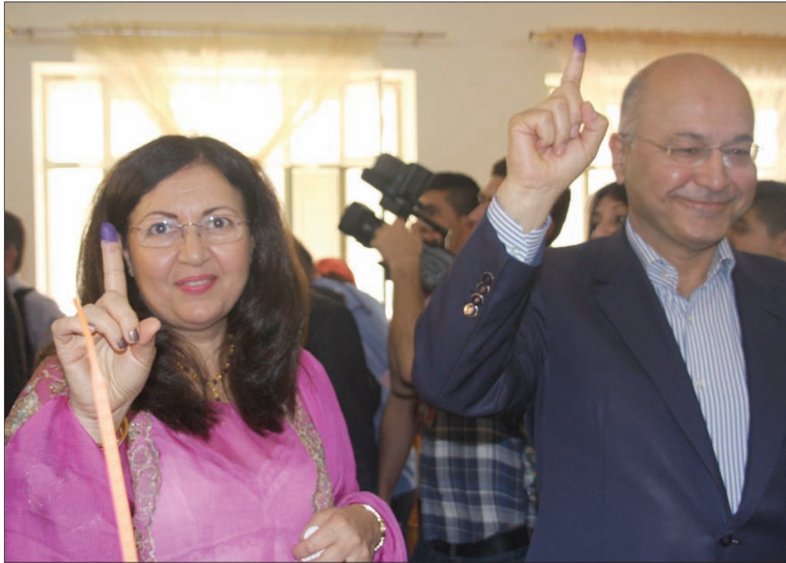
برهم صالح وزوجته في مركز اقتراع بمدينة السليمانية عام 2014

بغداد: حمزة مصطفى السليمانية، إحسان عزيز