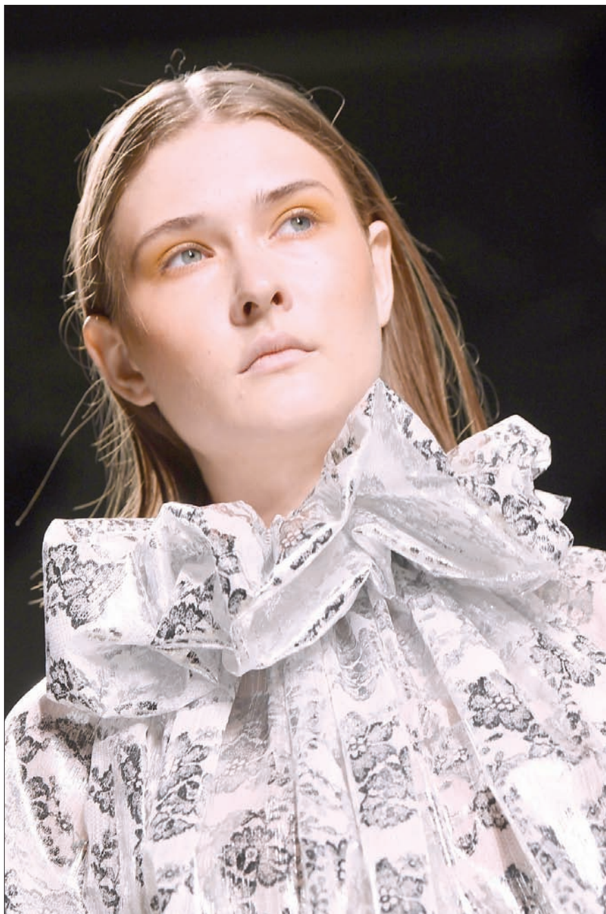
عارضة تقدم زياً لدار البرنو زامبيلي في عروض أسبوع الموضة بميلانو