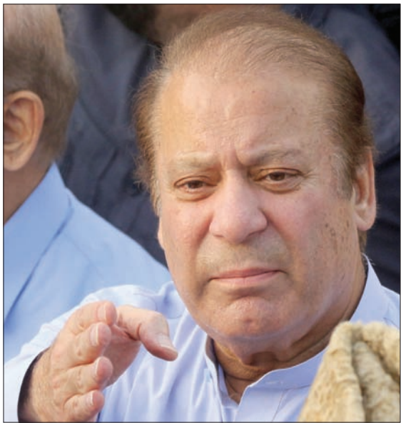
رئيس وزراء باكستان الأسبق الذي أطلق سراحه أمس

شيء غير اعتيادي». وكانت محكمة جرائم الفساد المالي أصدرت حكمها في السادس من الماضي غيابياً ضد نواز شريف بالسجن عشر سنوات ودفن غرامة مالية كبيرة، وابنته وابنته بسبع سنوات مع غرامة مالية، وزوجها محمد صفدر بالسجن سنة وغرامة مالية، ومنعهم من الترشح لأي منصب عام أو الانتخابات في باكستان، حين كانوا في زيارة لزوجته نواز شريف (كلثوم نواز) في أحد مشافي لندن، قبل وفاتها الأسبوع الماضي ودفنها في سيرجى إلى باكستان لمواجهة ما صدر ضده من حكم وصفه بالظالم، حيث عاد إلى لاهور في الثالث عشر من الماضي، وسلّم نفسه وابنته وزوجها للسلطات في مطار مدينة لاهور، وتم نقلهم إلى السجن المركزي في مدينة راولبندي، لكن أطلق سراحهم