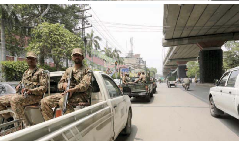
دورية للجيش في لاهور عشية الانتخابات

وزير الداخلية السابق نثار علي خان وعدد من الأحزاب الصغيرة للحصول على أغلبية مريحة في البرلمان وضمان عدم تآثر الحكومة بانسحاب أي حزب منها. لكن هذه الأوساط أشارت إلى إمكانية فوز حزب عمران خان بأكثر عدد من المقاعد إلى إمكانية عدم تولي عمران خان رئاسة الحكومة القادمة، المنصب الذي عمل للوصول إليه على مدى أكثر من عشرين عاماً، وذلك لعدم رضا