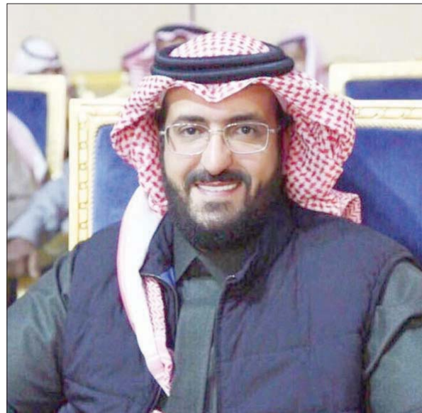
سعود آل سويلم رئيس نادي النصر