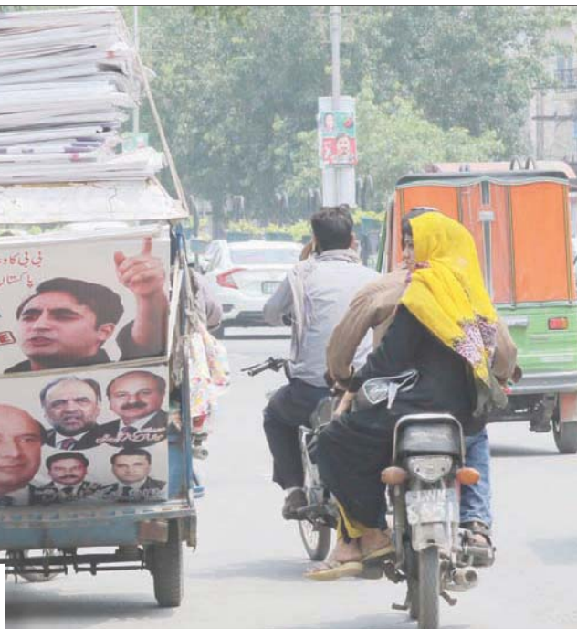
صورتا بيلال بوتو ونواز شريف على أفتات في البنجاب (أ.ب.)

وأشارت مراكز استطلاع تابعة لمؤسسات إعلامية باكستانية إلى تقارب النتائج بين حزبي حركة «الإنصاف» بزعامة عمران خان المقرب من الجيش وحزب «الرابطة الإسلامية» بزعامة شهباز شريف، شقيق رئيس الوزراء السابق نواز شريف، وأعطت كل حزب زهاء تسعين مقعداً، فيما أشار معهد «غالوب» العالمي - فرع باكستان في استطلاعه للأراء إلى إمكانية تقدم «الرابطة» بزعامة آل شريف وحصوله على قرابة المائة مقعد،