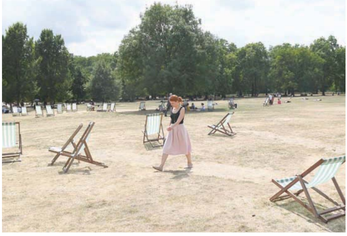
حداقق بريطانيا تعاني من الجفاف