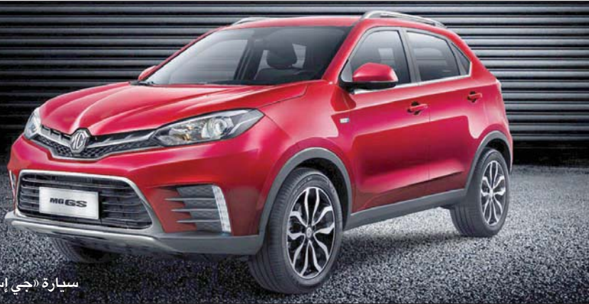
سيارة «جي إس» الجديدة من «إم جي»