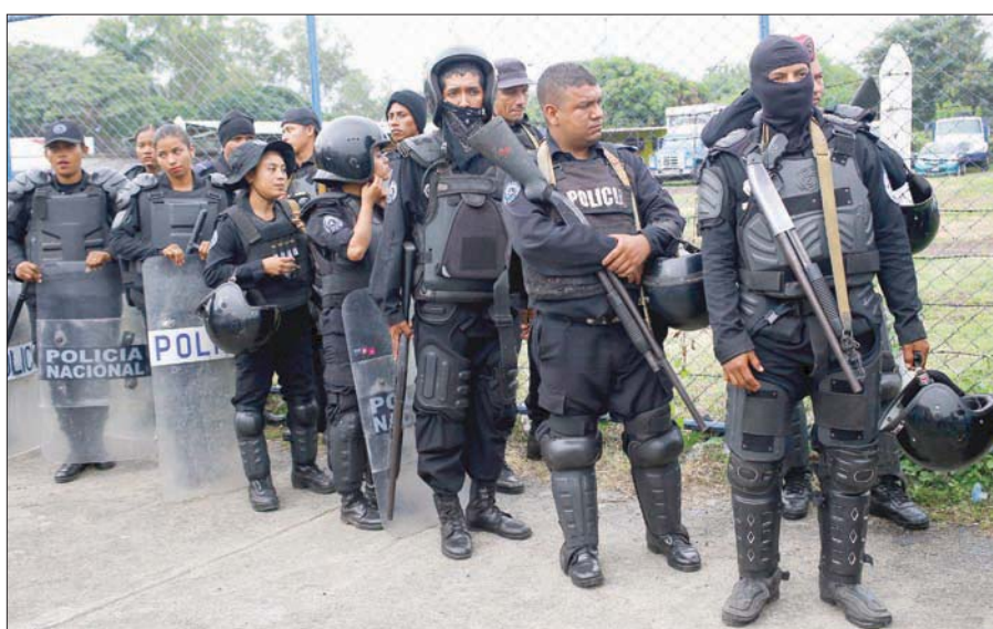
شرطة مكافحة الشغب خلال احتجاجات الاثنين في العاصمة ماناغوا

وفي مقابلة نادرة أذيعت الإثنين، قال أورتيجا لشبكة «فوكس نيوز»، إنه لا يعزله هو ولا زوجته روساريو موريللو التي تشغل أيضاً منصب نائب رئيس نيكاراغوا، إنشاء أسرة حاكمة، وإنه سيتم اختيار الحكومة القادمة في عام 2021. ويُنم أورتيجا (72 عاماً) قمع بشدة المظاهرات وأقام مع زوجته روساريو موريللو «ديكتاتورية» تقوم على الفساد والمحسوبية. وكانت منظمة الدول الأميركية أصدرت قراراً الأسبوع الماضي يدعو إلى إجراء انتخابات مبكرة في نيكاراغوا، وإنهاء موجة العنف السياسي، وحث جماعات الضغط الاقتصادية الرئيسية وجماعات أخرى في نيكاراغوا، أورتيجا على تقديم موعد الانتخابات القادمة في البلاد، التي من المقرر أن تجرى عام