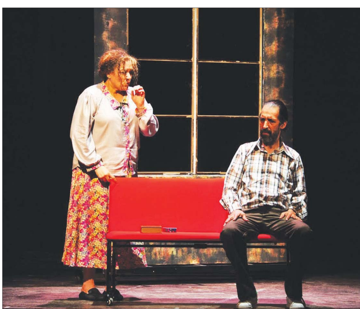
مشهد من مسرحية «نسيان» عن رواية «أمرأة النسيان» لمحمد براءة

ويخصوص إمكانية أن تتم عملية التحويل، من الرواية، مثلاً، إلى المسرح، بمعدل عن الكاتب، قال بنهدار: «نعم، لأن الروائي قال كلمته ومضى، يبقى دور الكاتب المسرحي وطريقة معالجته لهذا النص، لأنه لا يمكن أن نقول كل ما نقوله الرواية ككاتب مسرحي. بحسب النقد وتجربتك في الكتابة والقراءة تستشف الفكرة التي هي قيس يجب أن تلتقطه بسرعة فائقة، وقول: هذه الفكرة تستعصني في كتابة نص مسرحي للخشبة. بهذا المعنى أقول: إن الكاتب المسرحي يمكنه أن يكتب بمعدل عن الروائي مع إمكانية الاستشارة إن تطلب الأمر ذلك؛ مع العلم أن الروائي يدور يشتغل على نصه إلا إذا كان على يقين من قدرة الكاتب المسرحي ومعرفته بأسرار الكتابة الركيحة وهذا حق المشروع».