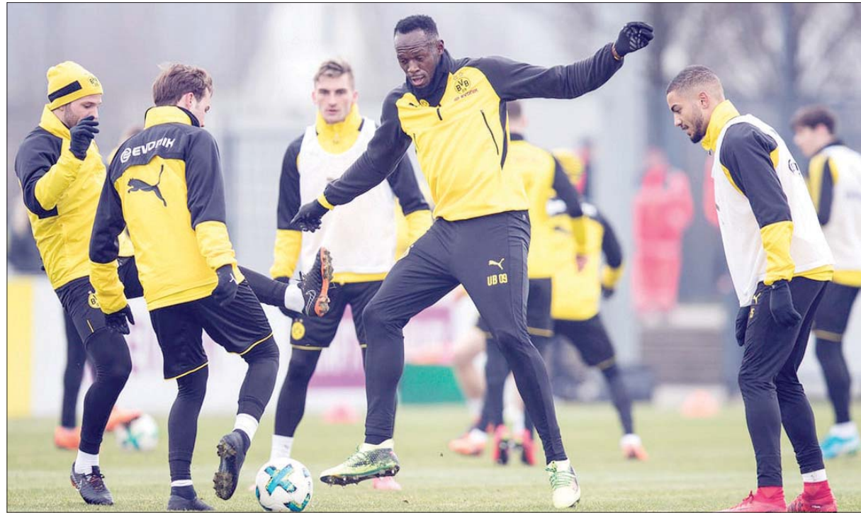
بولت تدريب مع دورتموند الألماني في مارس الماضي