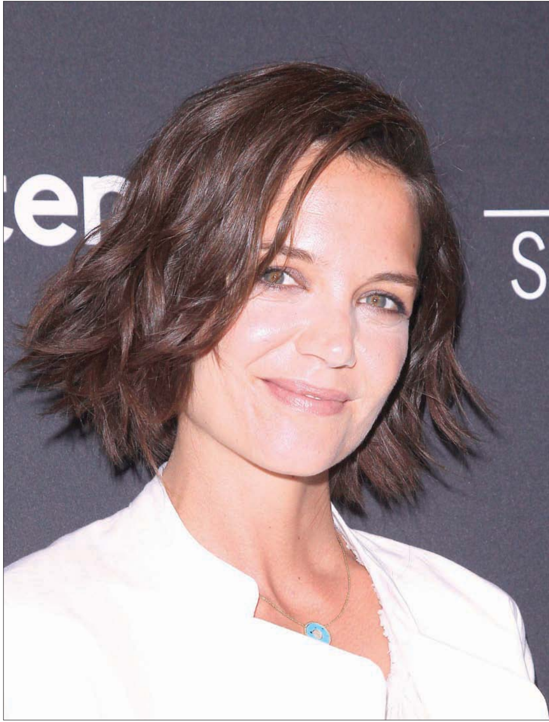
المثلة الأميركية كاتي هولز تحضر العرض الأول لفيلم «الزوجة» في مركز التصميم البياسيفيكي غرب هوليوود

أريد فقط الإشادة بوجود شخصيات مثل مي سكايف أو الروائية سمر يزبك ضمن صفوف الشعب السوري ضد هذا النظام العجيب. صحيح أنها أصوات لا تملك مقاتلين وميليشيات وعلاقات دولية، لكنها بالحد الأدنى تضمن أن الغضب السوري، في بدايته الأولى، قبل أن تلوته النصر وداغش ونداب تركيا ودببة سوريا وتعالق قطر وضياح إيران كان غضباً عفواً يعرف من كل الأنهار والينابيع السورية، دون لوعة طائفية أو دينية أو إثنية. مي سكايف... صفحة سورية بيضاء.