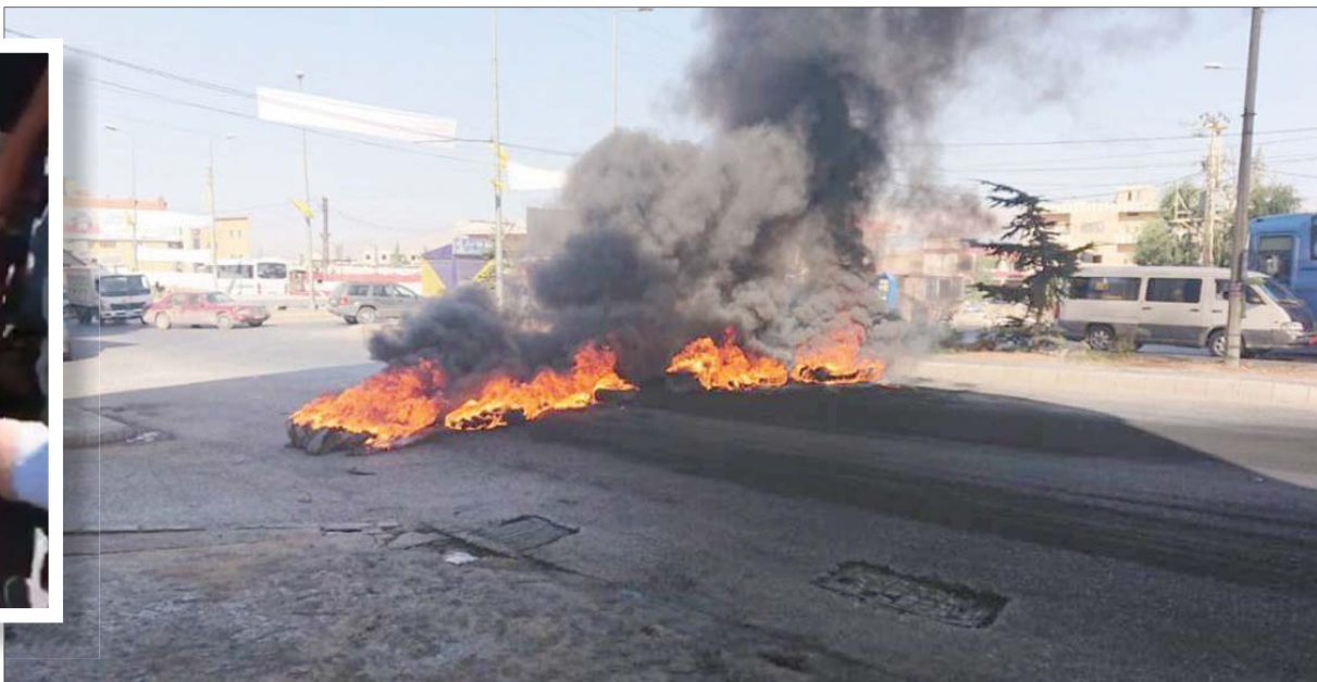
قطع الطريق الدولية في بريتل أمس احتجاجاً على أحداث الحمودية

ونوه وزير الدفاع الوطني يعقوب رياض الصراف، في بيان «بالإنجاز الذي حققه الجيش اللبناني إثر العملية التي نفذها