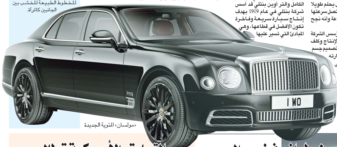
«مولسان» المئوية الجديدة

● تستخدم الشركة قطعة خشب واحدة في التصميم الداخلي بحيث تتوافق التفاصيل الداخلية للخطوط الطبيعية للخشب بين الجانبين كالرأفة.