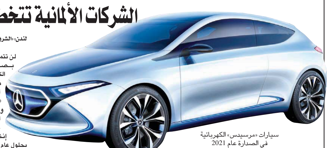
سيارات «مرسيدس» الكهربائية في الصدارة عام 2021

استراتيجية الشركات وتطور تقنيات البطاريات وشبكات الموردين والإنجاز المالي للشركات. وسوف تظل شركة «تيسلا» في المركز الأول خلال عام 2019، ولكن مع حلول عام 2021 عندما تصل نماذج كهربائية من الشركات الألمانية إلى الأسواق سوف يتراجع موقع «تيسلا» إلى المركز السابع. وفي عام 2021 سوف تكون شركة «مرسيدس» في المقدمة تليها شركة «بي إم دبليو» ثم مجموعة «رينو - نيسان - ميتسوبيشي» ثالثاً و«فولكسفاغن» رابعاً.