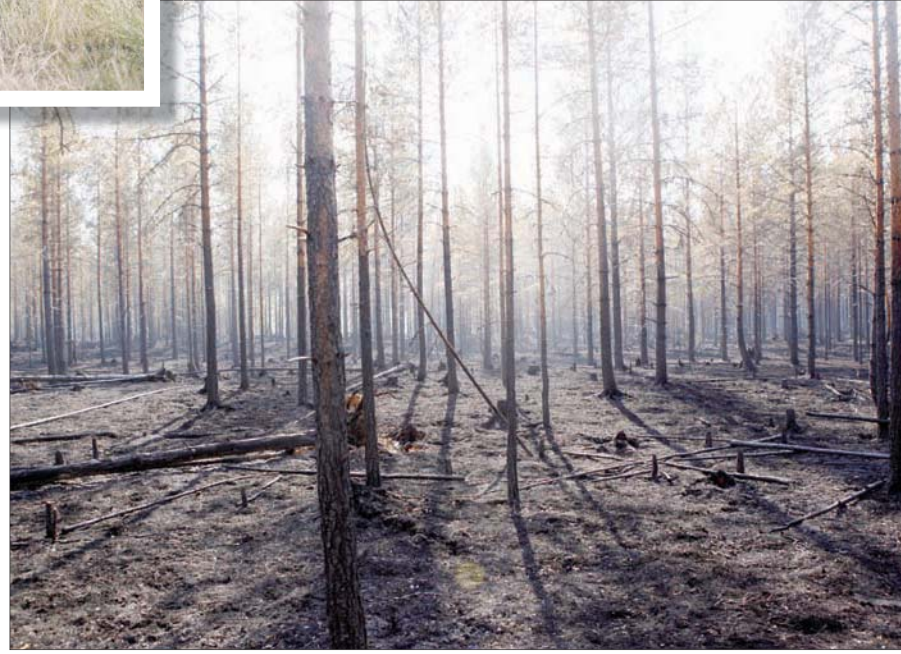
آثار حريق في السويد