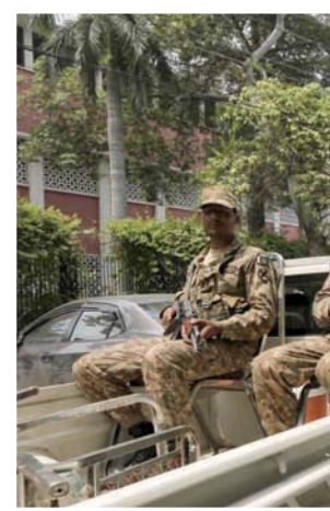
دورية للجيش في لاهور عشية الانتخابات

وأشارت هذه المصادر إلى أن عمران خان يحاول تركيز السلطات كافة في يده شخصياً وهو ما لا يريده الجيش في رئيس أي حكومة باكستانية. كما أهدت مصادر مقربة من الجيش الباكستاني إلى إمكانية «فرض» وزير الداخلية السابق تشودري نثار علي خان، في منصب رئاسة الحكومة القادمة لعدة