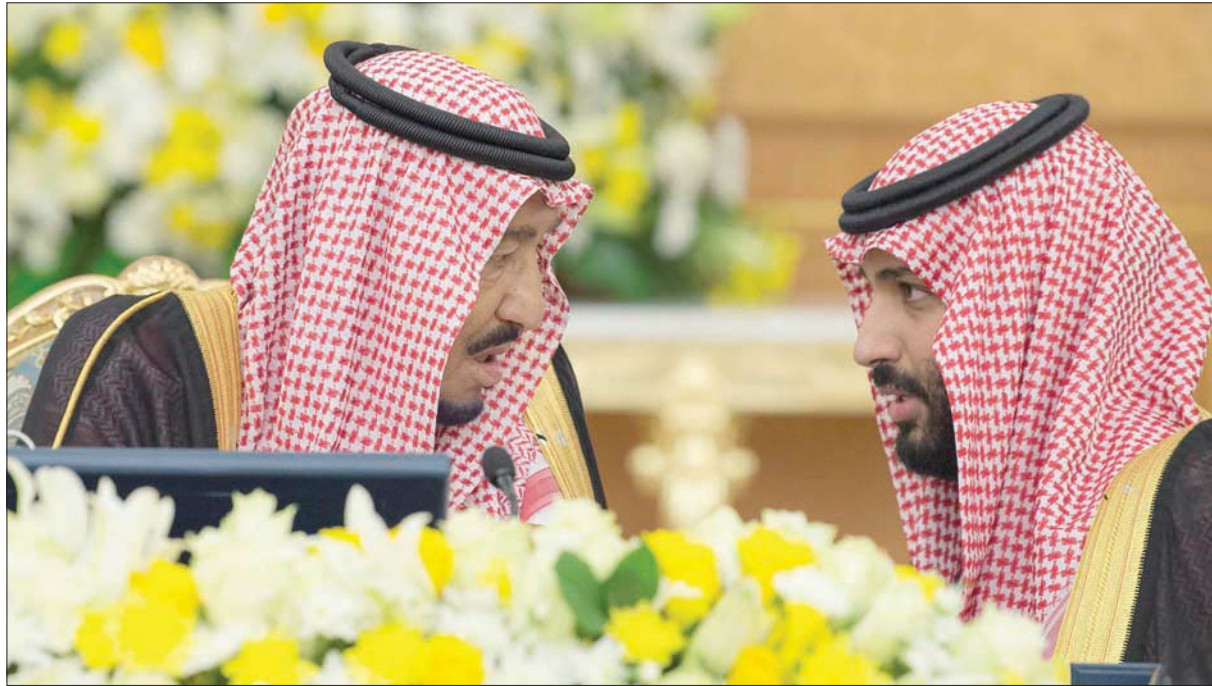
الملك سلمان في حديث جانبي مع ولي عهده الأمير محمد بن سلمان خلال ترؤسه جلسة مجلس الوزراء في جدة أمس (واس)

جدة، «الشرق الأوسط» رحب خادم الحرمين الشريفين الملك سلمان بن عبد العزيز بحجاج بيت الله الحرام الذين بدأوا بالتوافد من مختلف دول العالم إلى السعودية لأداء فريضة الحج، «سائلًا الله تعالى أن يتقبل حجهم ويوفقه لآداء الحج المبرور الذي ليس له جزاء إلا الجنة»، وذلك لدى ترؤسه الجلسة التي عقدها مجلس الوزراء في قصر السلام بجدة بعد ظهر أمس.