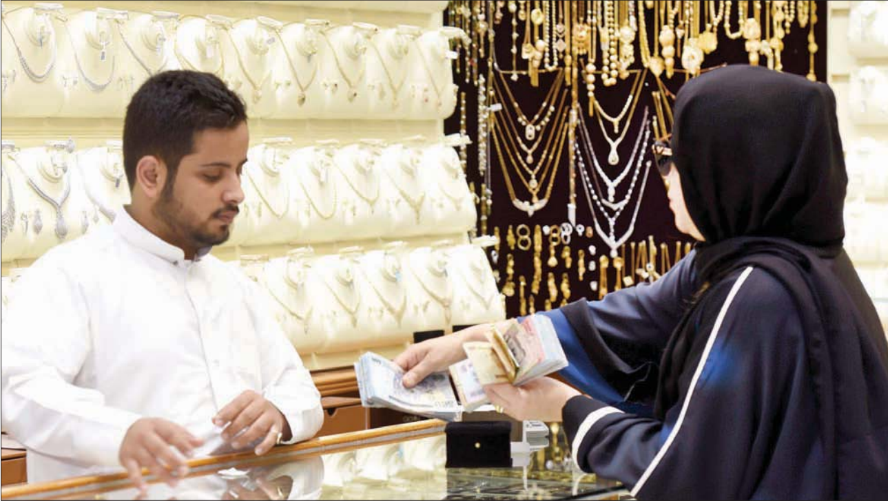
يتصدر قطاع الذهب مخالفات نظام التوطين في السعودية (الشرق الأوسط)

ويهدف «حجم سوق الذهب كبير جدا ومن الصعب توطينها خلال فترة قصيرة، وكانت هناك محاولة لذلك لكنها أربكت القطاع، إلى جانب أن كثيرا من العاملين القدامى خرجوا من السوق بعد خدمة عدة عقود، وخسرتهم السوق، بينما بالإمكان الاستعانة ببعضهم إلى جانب شبابنا السعودي». ويؤكد عزوز على أهمية أن تصدر الوزارة بتفهم آراء تجار القطاع والتعاون معهم في التوطين بما يتناسب مع طبيعة سوق الذهب والمجوهرات ومرعاة المصلحة العامة، ويضيف «على سبيل المثال فسوق الهواتف المحمولة التي عمرها نحو 20 عاما في السعودية، تعاني هو الآخر من صعوبة التوطين رغم حداثة، فما بالنا بسوق الذهب التي عمرها تتجاوز عشرات السنين».