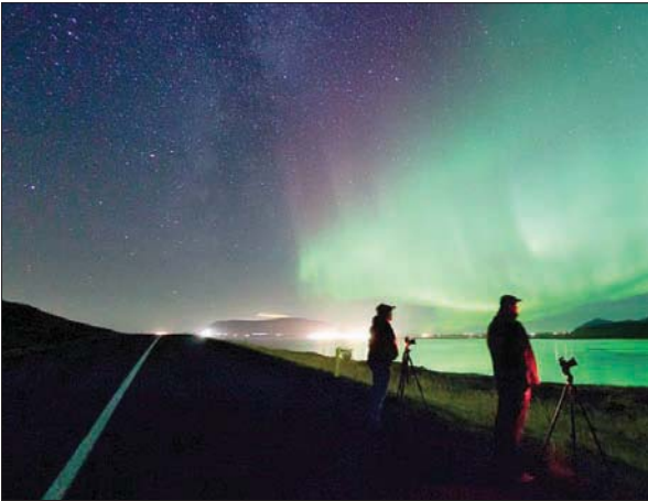
صورة سابقة لعاصفة جيومغناطيسية