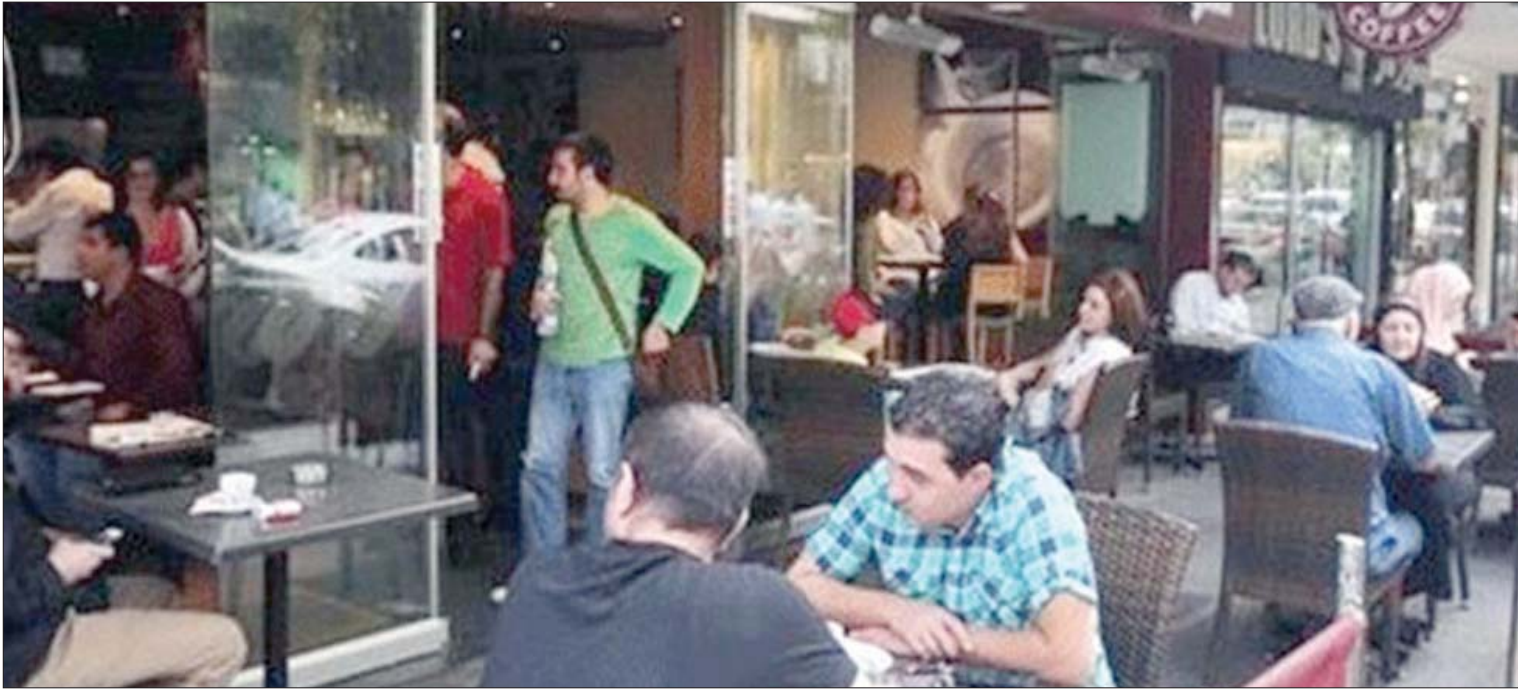
مقهى «كوستا» ببيروت

السريعة أو شركات الألبسة الجاهزة التي أنشئ بعضها لتمويه تبييض الأموال، دون أن يلتفت أحد من المعنئين إلى المشاهدات التي طالبت بحراسة الذاكرة الوطنية من التلف والتلاشي.