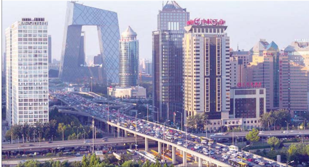
الاستثمار في قطاع العقارات بلغ 830 مليار دولار في النصف الأول من العام الحالي

«سينتم تطوير آلية طويلة الأجل لتعزيز التطور المطرد والصحي لسوق الإسكان».