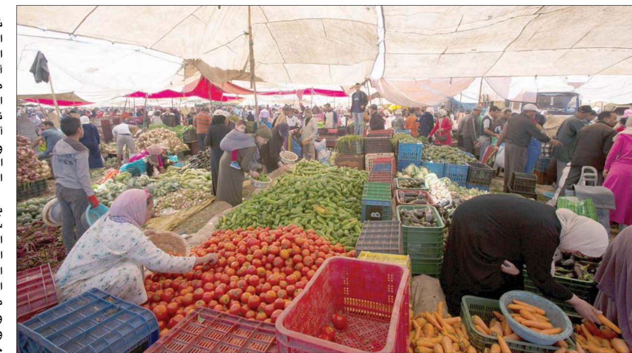
سوق شعبية مغربية لبيع الفواكه والخضراوات

وتطرق عدد من النواب إلى المشكلات التي يعاني منها المغرب اقتصاديا وبينها ضعف التنافسية وغياب الاندماج بين السياسات القطاعية الأمر الذي «يبقي المغرب في خانة الدول المتأخرة في طريق النمو، ويمنعه من الانتقال إلى خانة الدول الصاعدة».