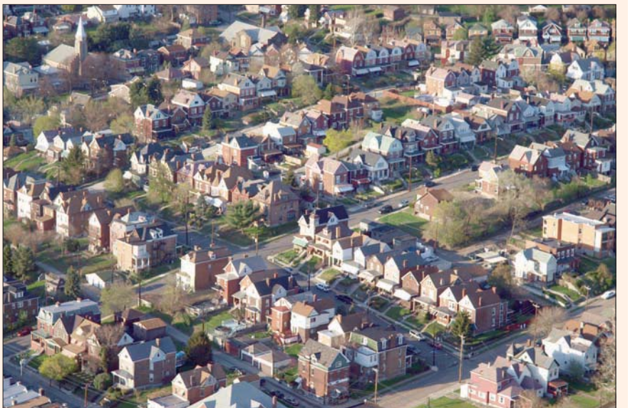
متوسط أسعار المساكن القائمة في يونيو الماضي ارتفع في 5,2 في المائة عن الشهر نفسه من العام الماضي

دبي، «الشرق الأوسط» أظهرت بيانات اقتصادية تراجع مبيعات المساكن القائمة في الولايات المتحدة خلال يونيو (حزيران) الماضي على خلاف التوقعات، وذلك للشهر الثالث على التوالي، وذكر «الاتحاد الوطني للمطورين العقاريين» في الولايات المتحدة أن مبيعات المساكن القائمة تراجعت خلال الشهر الماضي بنسبة 0,6 في المائة، مقارنة بالشهر السابق