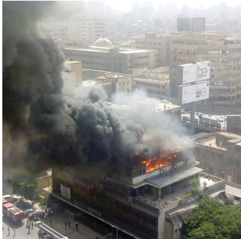
حريق مبنى نقابة التجار بين وسط القاهرة

وسوف يعلن عن حظر لاستخدام خراطيم المياه لري الحدائق في السادس من شهر أغسطس (أب) القادم للحفاظ على منسوب المخزون الاحتياطي من المياه في البلاد. ومن المتوقع أن تصل درجات الحرارة لقمعها اليوم وغداً قبل أن تبدأ في التراجع. وذكرت محطة بي بي سي أن جهاز الصحة البريطانية قد أصدر ثلاثة تحذيرات تجارية كبيرة، بينما لم تشهد سقوط أي ضحايا خلافاً لبعض الإصابات الطفيفة. وقالت مصادر أمنية إن «المعينة المدنية لتلك الحرائق، أظهرت اشتعالها نتيجة ماس كهربائي بسبب حرارة الجو». وتعرض مصر لموجة حارة منذ يومين، حيث وصلت بالنسبة لبريطانيا عامة شهدينا فقط