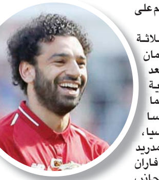
محمد صلاح

الدوري الإنجليزي وبلاده إلى الدور نصف النهائي من مونديال روسيا بمساعدة قائد المنتخب والمرشح الآخر لجائزة أفضل لاعب صانع ألعاب تشيلسي الإنجليزي إدين هازار. كما أدرج اسم مهاجم توتنهام