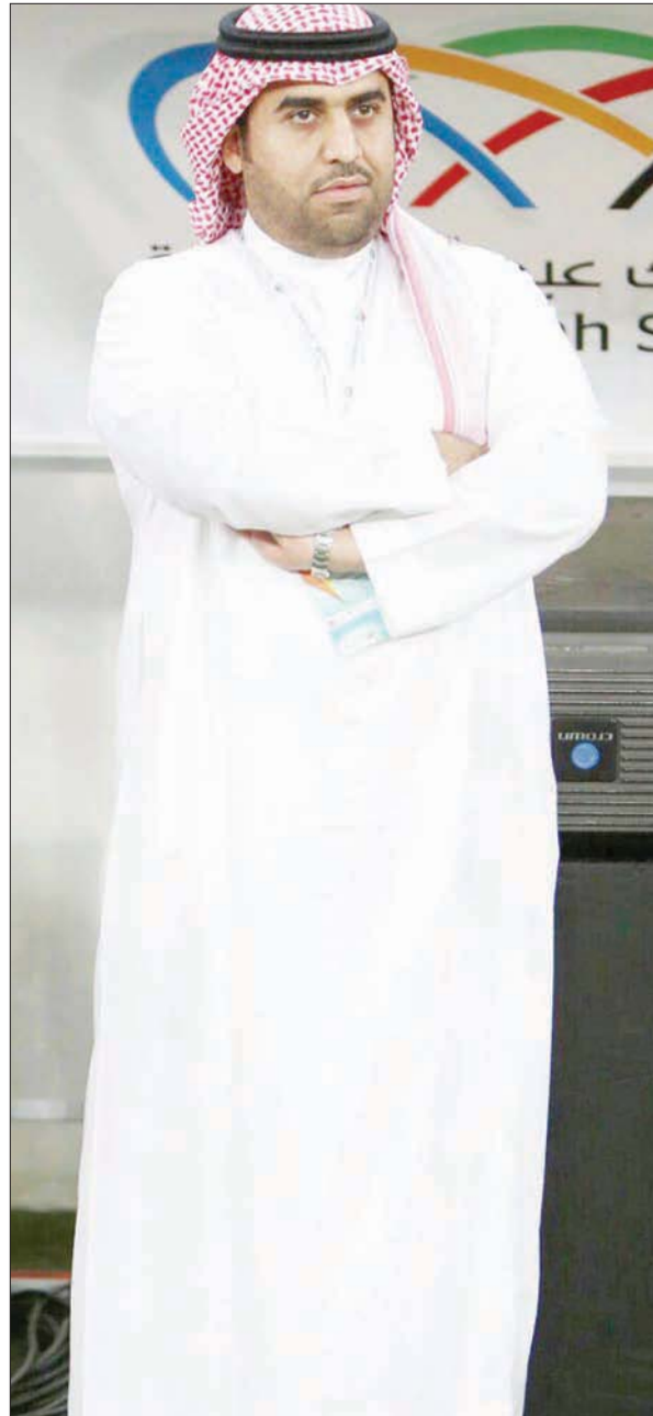
نواف المغير رئيس نادي الاتحاد

والتعاون والاتفاق مستندين على التجارب السابقة، ويحدثون مفاجأة مدوية في الدوري السعودي، مستغلين خبرتهم الطويلة في إدارات الأندية، ويطلبون الطاولة على حديثي الخبرة.