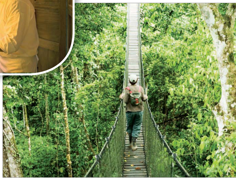
لم يعد السفر مجرد رفاهية مكان بل أيضاً تجارب فريدة ومغامرات

بها إلى بعض أكثر المدن الصديقة للبيئة على مستوى العالم. فندق «البلانجي» مثلاً ضم على نحو يشبه القرى الصينية التقليدية وشيد باستخدام الخشب والأحجار واليامبو من البيئة المحلية. وبالمثل، زادت جاذبية «نيكوبي سورتينغ ريزورت أند ريزيرت» بنيكاراجوا بفضل التزامه بالرفاهية المستدامة. ويقع منتجع نيكوبي الذي افتتح العام الماضي داخل مدينة نانديم