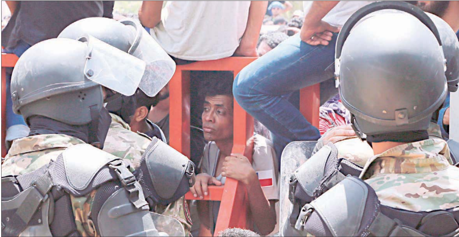
شرطة مكافحة الشغب تمنع المتظاهرين على تزدى الخدمات من اقتحام مبنى مجلس المحافظة المعترضين في البصرة الأسبوع الماضي