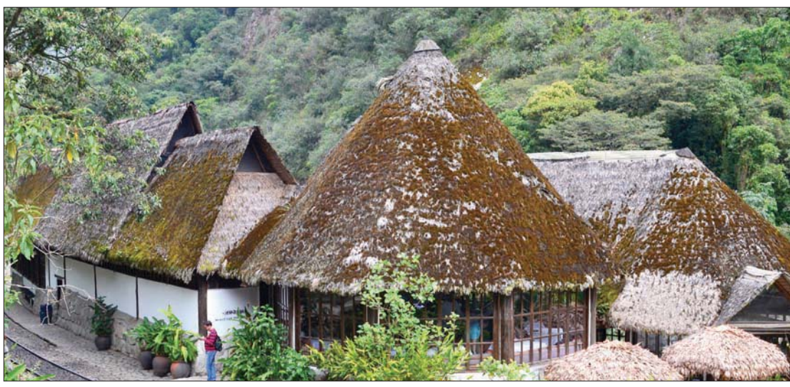
بيوت صديقة للبيئة في البيرو

يعود إلى شريحة من المسافرين الباحثين عن التجارب الجديدة والمغامرات، بما فيها مراقبة الطيور والتعرف على نبات السحلية أو على فنون الطهي. كل هذا شجع الفنادق على أن تأخذ الثقافات المحلية بعين الاعتبار عند تصميمها، باستخدام مواد طبيعية مأخوذة من البيئة المحلية. بالنسبة لبيرو، على سبيل المثال، نجد أنها تنطوي على مجموعة هائلة من الحقائق المذهلة والتي حينما يتعرف عليها المسافرون تفتح أمامهم إمكانات جديدة لخوض تجارب أروع.