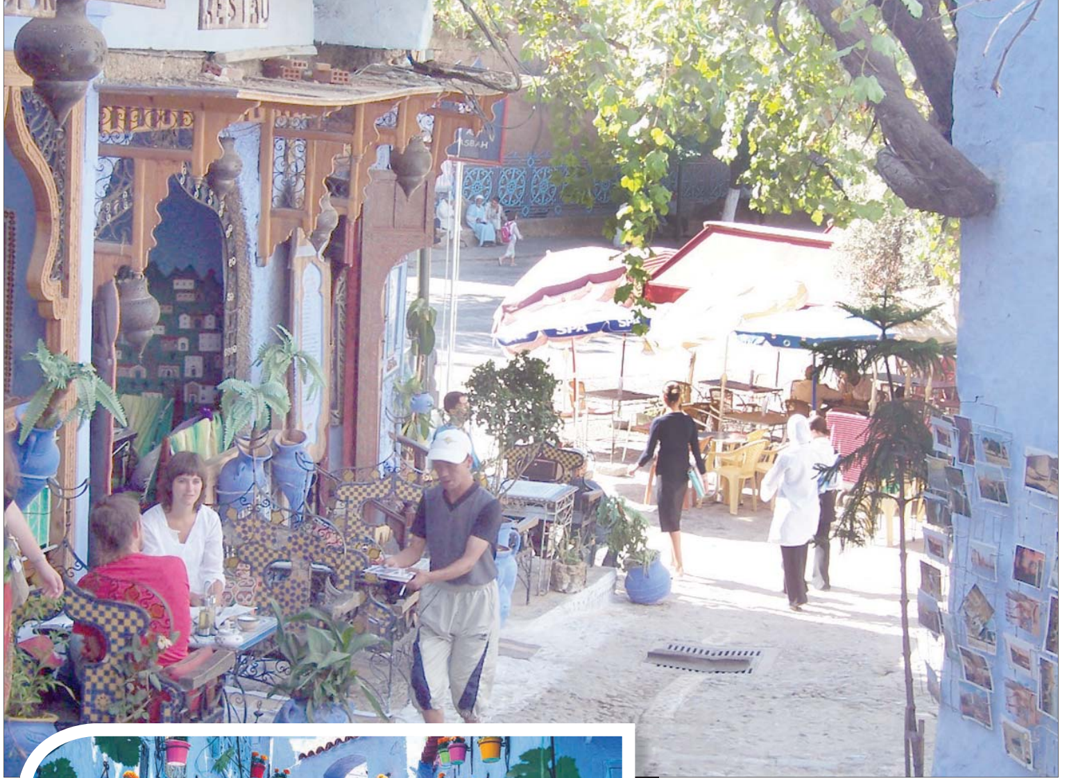
ساحة «وطاء الحمام» المفضلة لدى السياح