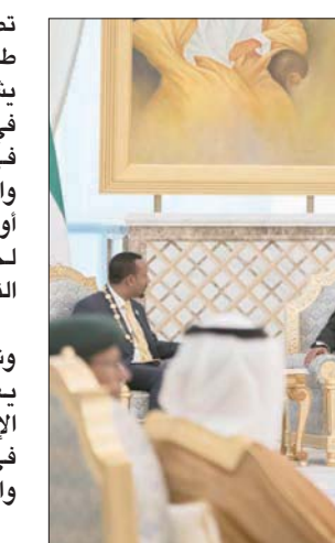
الشيخ محمد زايد وأفورقي وأبي أحمد في أبو ظبي أمس

وأكد أن أكثر ما يسعد الإمارات، قيادة وشعباً، هو رؤية السلام والأمن والأزدهار يعم المنطقة والعالم، مشدداً على أن الإمارات لن تتردد في المشاركة الفاعلة في كل ما من شأنه أن يعزز قيم السلام والتعايش والتنمية بين الأمم والشعوب. وازد: «إن وجود الرئيس أساساً