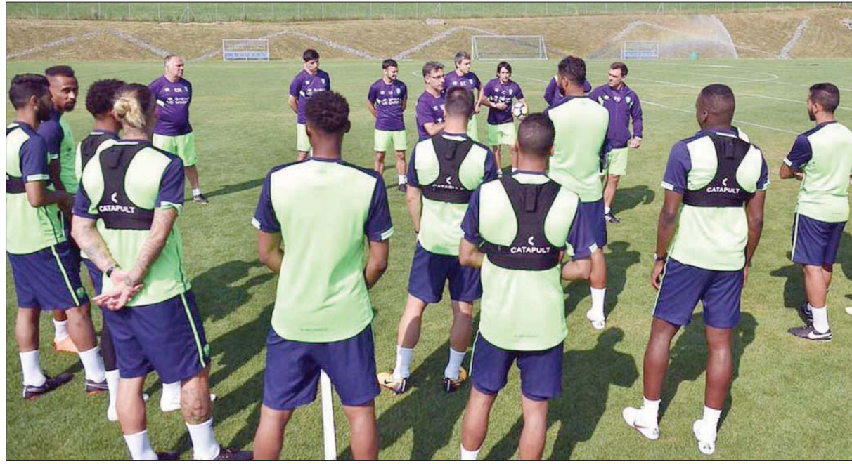
غويدي يجتمع بلاعب الأهلي قبل انطلاقه مران أمس

قادات اللاعبين ولتطبيق النهج المنافسات المقبلة، مع توضيح أبرز الحالات التي تحدث خلال التدريبات الماضية وشرحه الأخطاء التي عادة ما يقع فيها اللاعبون، مع قيامه بعرض البرنامج الفني للفريق خلال الفترة المقبلة. ويجري مدرب الأهلي للاعبين مشاورات مصغرة على منتصف الملعب لاستكشاف تحقيق الإضافة الفنية المطلوبة لخط المقدمة في فريق الأهلي خلال المنافسات المقبلة. وشرع مدرب فريق الأهلي غويدي في التركيز الكبير على النواحي التكتيكية بعد انقضاء أسبوع كامل منذ انطلاق المعسكر في النمسا، من خلال التدريبات اليومية، مع عمله على إقامة محاضرات نظرية لشرح النهج الفني الذي يرغب في تطبيقه