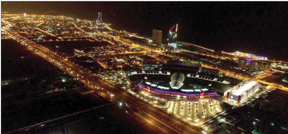
«رد سي مول» في جدة سيشهد داراً سينمائية تضم أكبر شاشة عرض