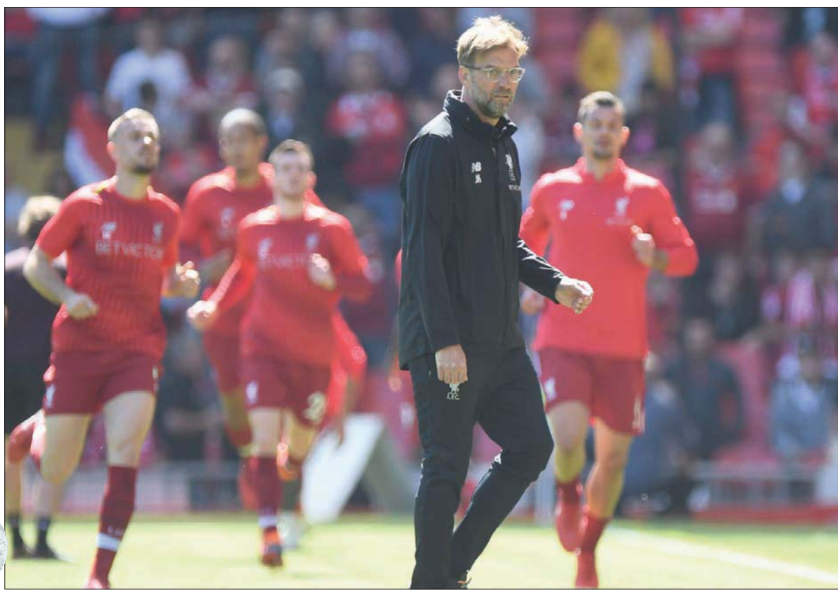
كلوب يأمل أن تثمر صفقات ليفربول الجديدة في دفع الفريق لمنصات التتويج (أ.ف.ب)

وسط فرنسا إلى جانب نغولو كانتو وسجل في النهائي لتتوج فرنسا باللقب للمرة الثانية في تاريخها. وقال مورينيو: «لأ اعتقد أن الأمر يتعلق بنا لإخراج أفضل ما لديه، يجب عليه أن يقدم أفضل ما لديه. أعتقد أن كأس العالم كانت البيئة المناسبة للاعب مثله ليقدم أفضل ما لديه». وأضاف: «لماذا؟ لأنها تمتد لشهر ولا يمكن أن تفكر خلالها سوى في كرة القدم... عندما يكون مع فريقه في معسكر التدريب، فإنه يصبح معزولا تماما عن العالم الخارجي ويكون كافة التركيز على كرة القدم. إبعاد اللعبة هي الوحدة التي تمثل الحافز للاعبين». وواصل: «على مدار موسم كامل، تمر بك مباراة كبيرة وأخرى صغيرة وثالثة متواضعة وقد تفقد تركيزك... ثم تأتي مباراة كبيرة على عمله».