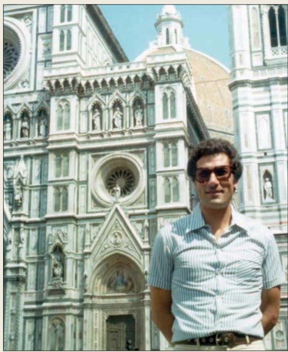
في روما أيام الشباب

● أول رحلة لي خارج مصر كانت لبلجيا، وقد مرت قبلها