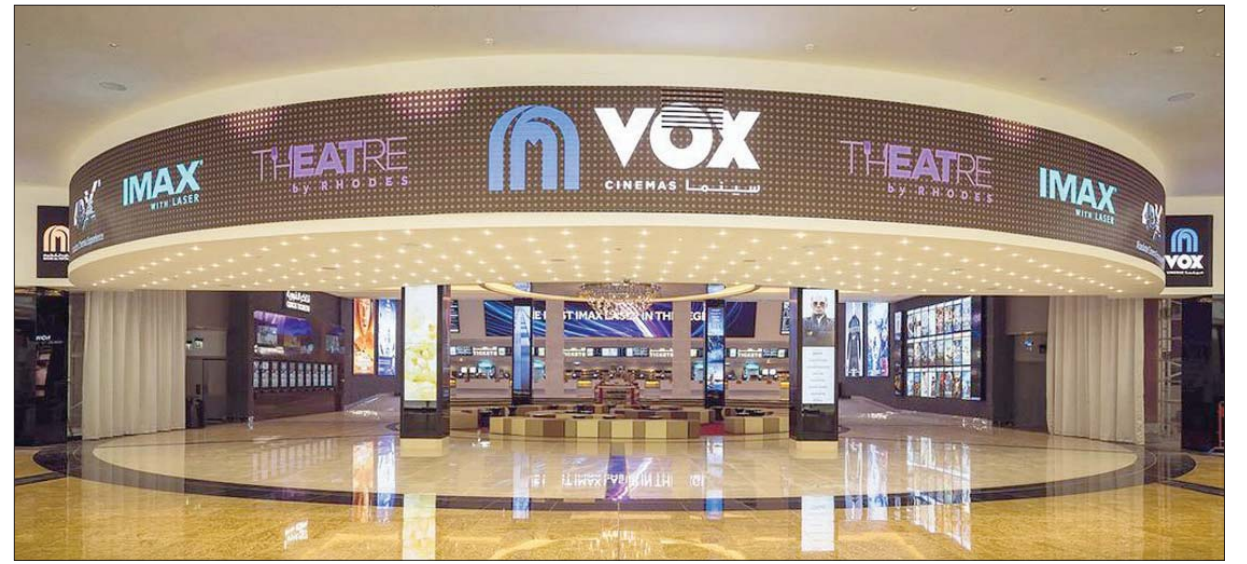
الدار الجديدة ستوفر 18 شاشة

تعرضها فوكس سينما بين الأكنش والربيع والأفلام العائلية والدرامية التي تعد الضخم ضمن قائمة البوكس الأوفيس حيث حققت أعلى نسبة مشاهدة وأعلى الإيرادات عالمياً ومنها أفنجرز وبلاك بانثر وكويت بليس وفندق ترانسيلفانيا 3 وسكاي سكريبر وغيرها. وكانت فوكس سينما أعلنت في شهر يوليو (تموز) الحالي عن افتتاح دار سينما لها في جدة. في نهاية العام الحالي في رد سي مول. ومن المقرر أن تشمل هذه السينما أكبر شاشة عرض إيماكس في المملكة بالإضافة إلى