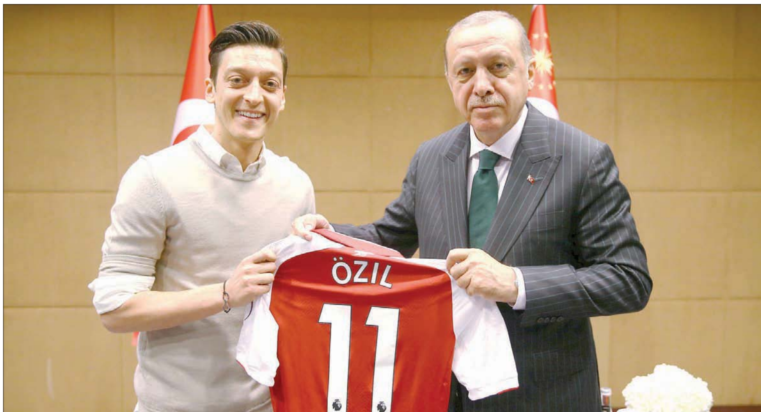
صورة أردوغان مع أوزيل التي أثارت الجدل

المنتخب الوطني. اتخذ الآن قراراً في الدوري الإنجليزي لكرة القدم. وتغربت مشكلة أوزيل قبل كأس العالم 2018، حين ظهرت له صورة مع أردوغان استغللتها أحزاب يمينية ألمانية في شن حملة كبيرة على صانع العاب المنتخب على مواقع التواصل الاجتماعي، ولم يتدخل الاتحاد الألماني لمساندة أوزيل قبل مونديال روسيا، خصوصا أن رئيس الاتحاد رينهارد غريندل هو نفسه الذي صرح عام 2004 بأن وجود منتخب متعدد الجنسيات والتقاطعات هو كذبة. لكن فوز ألمانيا بمونديال 2014 بعدها 10 سنوات كان كافياً لتأكيد خطأه. وعندما حاول أن أشرح لغريندل تراتي وأصلي، وبالتالي السبب وراء تلك الصورة، كان أكثر اهتماماً بالحديث عن أرائه السياسية، والقليل من رأيي». وتحول أوزيل إلى كيش فداء بسبب صورته مع أردوغان، بينما ابتعد الانتقاد عن لوف المدير السبي، تكتيكياً وفتياً، وحملت المسؤولية أداء أوزيل.