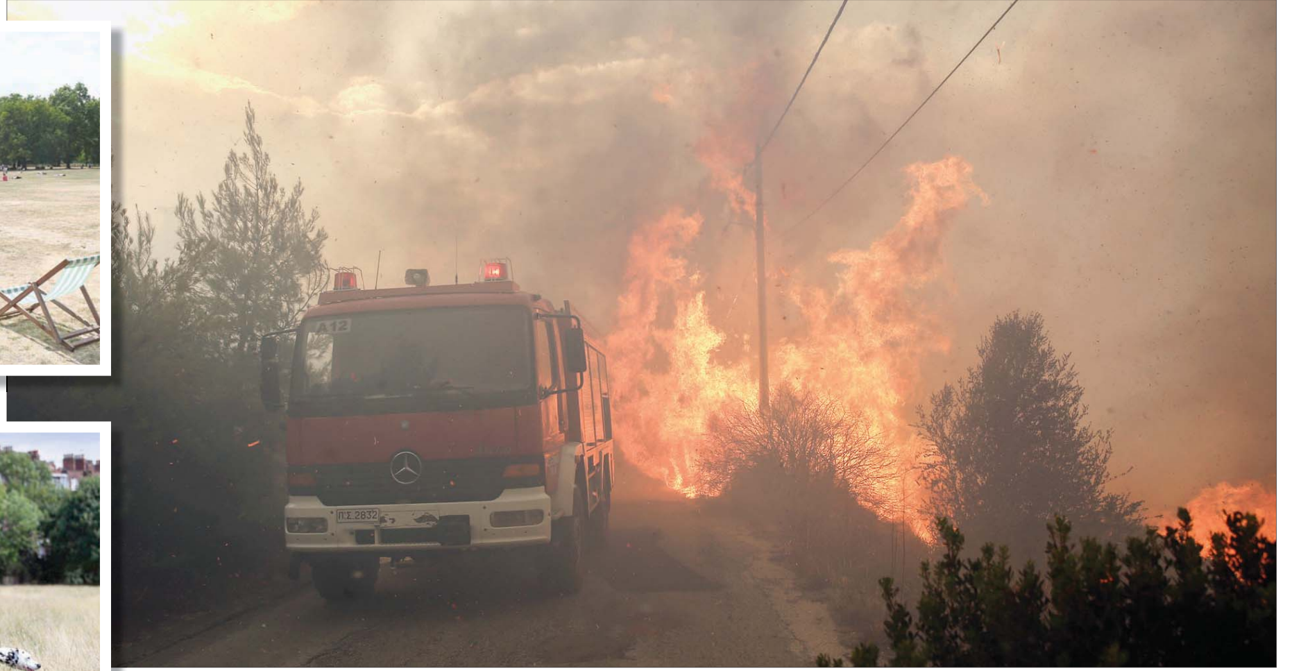
الحرائق في اليونان تسببت بوفاة أكثر من 70 شخصاً

السويد ومخاطر حرائق جديدة وجهت السلطات السويدية الاثنين نداء بضرورة التفتظ حيال المخاطر «الكبيرة» لاندلاع حرائق جديدة مع اقتراب موجة الحر في حين أن الوسائل المتاحة في العديد والعتاد باتت في أقصى حالات التأهب حسب تقرير لوكالة الصحافة الفرنسية. ولم تسجل السويد في بعض مناطقها أي هطول للأمطار الحرائق في الأشد ضرراً منذ تلك التي أسفرت عن 77 قتيلاً في 2007. وقال تساناكوبولوس إن السلطات تواصل عمليات البحث عن ضحايا وإجلاء السكان المتأثرين من جراء الحرائق. لافتاً إلى أن إسبانيا سترسل طائرات لمساعدة اليونان، فيما ستبعث قبرص فريقاً من 60 رجل إطفاء، ولجات اليونان إلى تفعيل آلية الحماية المدنية الأوروبية للحصول على المساعدة من شركائها في أوروبا. وحصلت البلاد على المساعدة خصوصاً عبر الوسائل الجوية من فرنسا وإسبانيا وإسرائيل وبلغاريا وتركيا وإيطاليا ومقدونيا والبرتغال وكرواتيا، فيما توالى رسائل التعزية من الخارج. وكتب رئيس المفوضية الأوروبية جان - كلود يونكر أن «المفوضية لن تدخر جهودها لمساعدة اليونان».