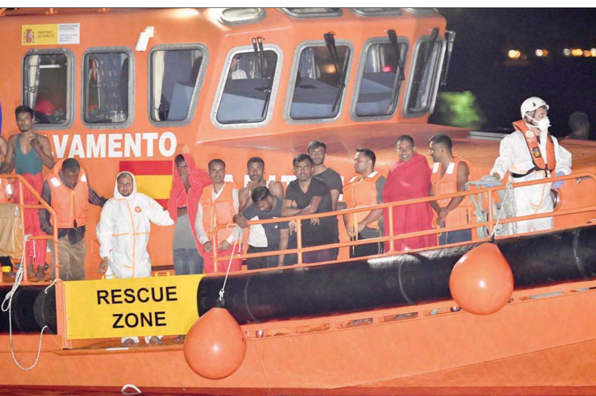
مهاجرون على قارب إنقاذ يصلون إلى ميناء الميرا الإسباني الجنوبي أمس

على تدفق المهاجرين. وقال وزير الخارجية جان هاماسك، زعيم الحزب الاجتماعي الديمقراطي، كما نقلت عنه الوكالة الألمانية «من الواضح أن مسارا جديداً للمهاجرين يصلون عبر طريق البلقان البري والمار عبر البانيا، والبوسنة والهرسك، وصربيا، وبلغاريا ومنها إلى أوروبا الوسطى. ومنذ ذلك الحين، جرى تعزيز إجراءات الأمن على الحدود في المنطقة بصورة كبيرة. إلا أنه وفقاً للامم المتحدة، فإن 7600 مهاجر جديد تم تسجيلهم في البوسنة في النصف الأول من العام. وكانت الفترة نفسها من العام الماضي قد شهدت تسجيل 218 شخصاً فقط. تجدر الإشارة إلى أن القادمين الجدد ينحدرون من باكستان وسوريا وأفغانستان ويدخلون البوسنة والهرسك عن طريق صربيا. وأمس وفي السياق نفسه، أعلنت حكومة جمهورية التشيك أنها ستقدم ما يقرب من مليون يورو للبوسنة والهرسك للمساعدة في تعزيز أمن الحدود بهدف السيطرة