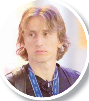
لوكا مودريتش

إنجلترا هاري كين الذي توج هدافا لكأس العالم بسنة أهداف. وعند المديرين، تقدم الفرنسي ديبديه ديشامب لائحة المرشحين لنيل جائزة أفضل مدرب بعد قيادته منتخب بلاده إلى اللقب العالمي للمرة الثانية في تاريخه بعد 1998. وضمت اللائحة فرنسا آخر هو مدرب ريال مدريد زين الدين زيدان الذي ترك الفريق الملكي بعد أن قاده للقب ثالث تواليا في دوري الأبطال. كما ضمت اللائحة ماسيميليانو بيرغري (يوفنتوس الإيطالي)، ستانيسلاف تشيرتشيوسوف (منتخب روسيا)، ونالكو بيتش (منتخب كرواتيا)، والإسباني جوسيب غوارديولا (مانشستر سيتي الإنجليزي)، والألماني يورغن كلوب (ليفربول الإنجليزي)، والإسباني روبرتو مارتينيز