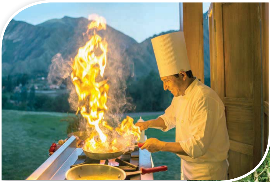
يتبارى الطهاة المهرة في استعمال المنتجات الموسمية

الجديدة، أو زراعة أشجار القرم على الضفاف بدعم من علماء عالميين ومؤسّسات معنية بالحياة البرية مع تزويد الموظفين، والعملاء والمؤدّين بالتدريب اللازم. والجدير ذكره أن فندق كونستانس هالافيلي استهمل منذ سنوات قليلة برنامجاً ناجحاً جداً لإعادة تنمية الشعاب المرجانية، سعياً إلى تنشيط نمو الشعاب المرجانية في البحيرة حول المنتجع، والمساعدة في إصلاح الضرر الناجم عن التسونامي عام 2004. ليكون أول فندق ينادي بعلامة السياحة المستدامة في جزر السيشل من همة السياحة في عام 2012. أما عام 2005، فتعني أشجار القرم كصوف ذي أهمية بيئية دولية، حدود المنتجع، ما يتيح لضيوفه فرصة رائعة للاستمتاع بالقرب