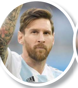
ليونيل ميسي