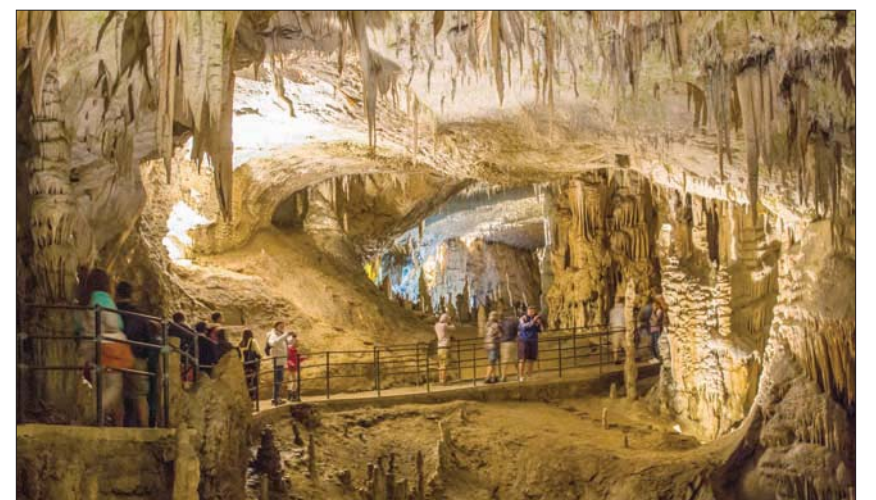
تندن، «الشرق الأوسط»

استراتيجية السياحة الخضراء في عامي 2009 و2010. وفي 2011 كان الهدف تمكين البلاد لتصبح واحدة من أكثر البلدان استدامة في العالم. في سياق متصل دعم مجلس السياحة السلوفيني البرنامج الوطني الذي أطلقت عليه «الخطة الخضراء» للسياحة السلوفينية ضمن معايير دولية. ويعكس فوز سلوفينيا بهذه الجائزة المشهورة والمعترف بها دولياً، مدى حرص الحكومة السلوفينية ومسؤولي السياحة على الحفاظ على نوعية الطبيعة الساحرة وجمالية المساحات الخضراء ضمن أعلى المواصفات مع رعاية المبادرات الوطنية التي تساهم في جعل البلد وجهة جذابة للسياحة العافية وشهر العسل والاستجمام وراحة البال.