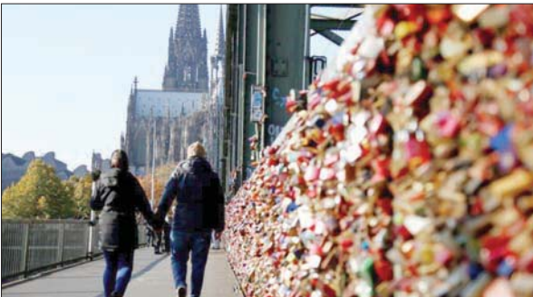
أقفال الحب على الجسر

كل العالم، خصوصاً أن الجسر يقع في قاعدة كاتدرائية كولون التاريخية العملاقة.