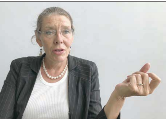
المنسقة الخاصة للأمم المتحدة في لبنان بيرنيل كارديل

الوطني، مؤكدة أنها «تشعر بان هناك إجماعاً في لبنان على أن الوقت قد حان لإجراء هذه المناقشات». وشجعت الأطراف اللبنانية على مواصلة التزام بيان بعبداء، وسياسة النأي بالنفس عن النزاعات في ما يتعلق بتطور «حزب الله»