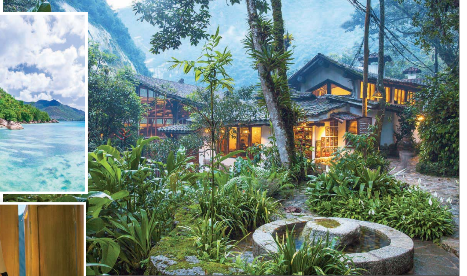
أماكن إقامة صديقة للبيئة في ماتشو بيتشو (إنكاتيرا)

وتنتمي ملكيتها بأكملها إلى نيكاراغوا. ويعتمد على سياسة من المزرعة إلى الطاولة حيث يعتمد الطهاة لديه على منتجات زراعات قائمة على مساحة 1,208 متر مربع أو جهات توريد محلية. ويعتمد المنتجع على تصميم مستوحى من البيئة المحلية، كما حرص على إعادة زراعة غابات في مساحة 1,300 فدان محيطية به وزرع أكثر من 14,000 شجرة بحيث تحظى نزل المنتجع اليوم على ملاذ داخل الطبيعة يتميز بوحدة إقامة فاخرة متمتزة بالبيئة. وإذا استمر الأثرياء من أبناء الألفية الجديدة في تفضيلهم للعلامات التجارية المستدامة، فإن الحكمة تقتضي أن تعمل المنتجعات السياحية التقليدية على ابتكار سبل جديدة لاجتذابهم بتقليص اعتمادهم على الوسائل التقليدية وتبنيهم طرق حديثة في التعامل مع السياحة والترفيه عموماً. وفي عام 2014، وفي جزر