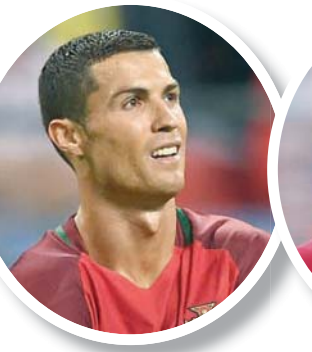
كريستيانو رونالدو