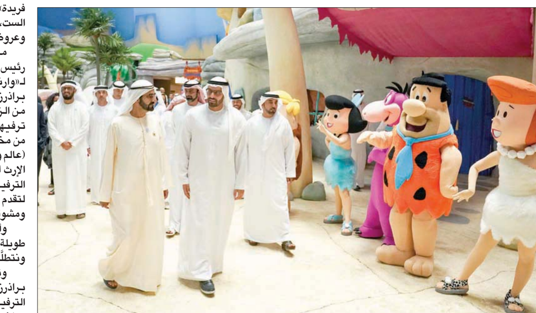
الشيخ محمد بن راشد والشيخ محمد بن زايد خلال تدشين المدينة أول من أمس

جنبا إلى جنب مع شركائنا في (وارنر براذرز إنترتينمنت) تحقيق رؤيتنا المشتركة الرامية إلى تطوير مدينة ترفيهية، عبر تقديم تجربة ترفيهية