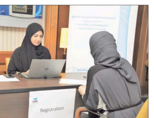
جانب من استقبال الطالبات في البرنامج