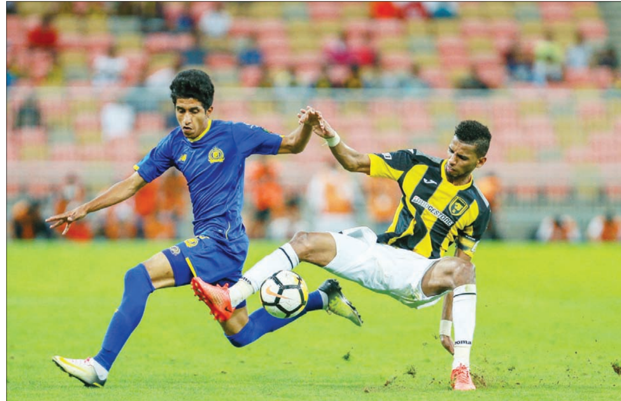
مباريات الدوري السعودي ستظهر بشكل مختلف بسبب مشاركة عدد كبير من المحترفين الأجانب