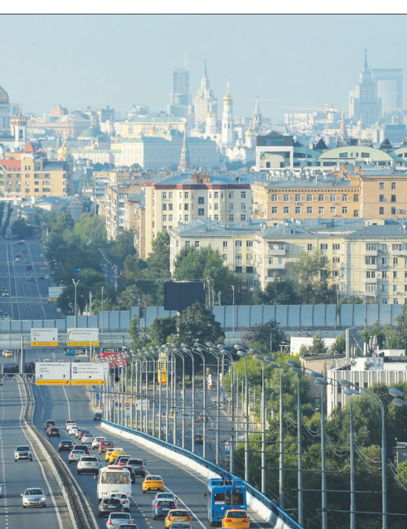
تواصل الحكومة الروسية خططها الرامية إلى تحقيق هدف النمو الاقتصادي