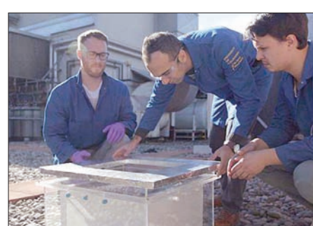
«حاصد المياه» الجديد

الأمونوم في زيادة عملية هذا الهيكل في إنتاج المياه بسبب انخفاض كلفته. وينتشر الهيكل الفلزي - العضوي على سطح الصندوق الداخلي ويعمل كالإسفنج، ويجمع الصندوق الخارجي المياه الرطبة نتيجة ارتفاع درجات الحرارة.