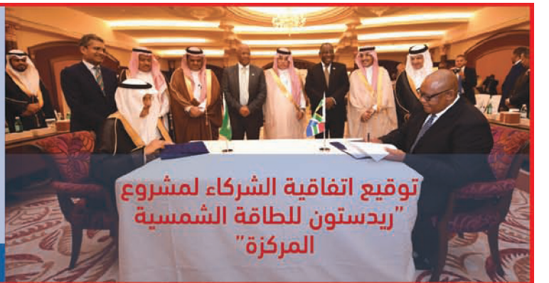
توقيع اتفاقية الشركاء لمشروع "ريدستون للطاقة الشمسية المركزية"