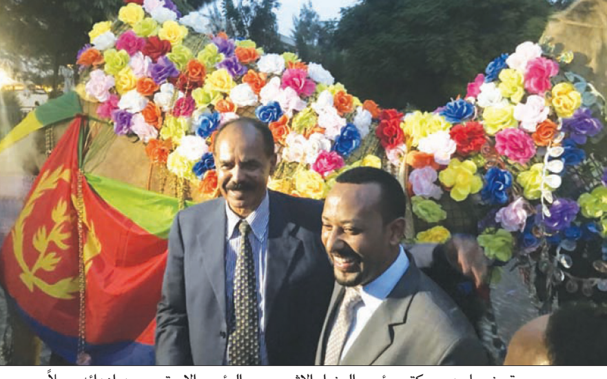
صورة وزعها مدير مكتب رئيس الوزراء الإثيوبي مع الرئيس الإريترى بعد إهدائه جملاً

ووفقاً لبيان أصدره مكتب أسي، فقد أكد ماكرون دعم فرنسا الإصلاحات الجارية في إثيوبيا، داعياً رئيس حكومتها لزيارة العاصمة الفرنسية باريس. ويتهيأ أفورقي اليوم زيارة استغرقت 3 أيام إلى إثيوبيا بعد أقل من أسبوع من إعلان البلدين انتهاء الحرب بينهما بعد مواجهة عسكرية استمرت نحو 20 عاماً بعد حرب حدودية، وتسهم المصالحة بين البلدين في إحداث تغيير في السياسات وفي الأمن بمنطقة القرن الأفريقي المضطربة التي فر منها مئات الآلاف من الشباب سعياً وراء الأمان والفرص في أوروبا.