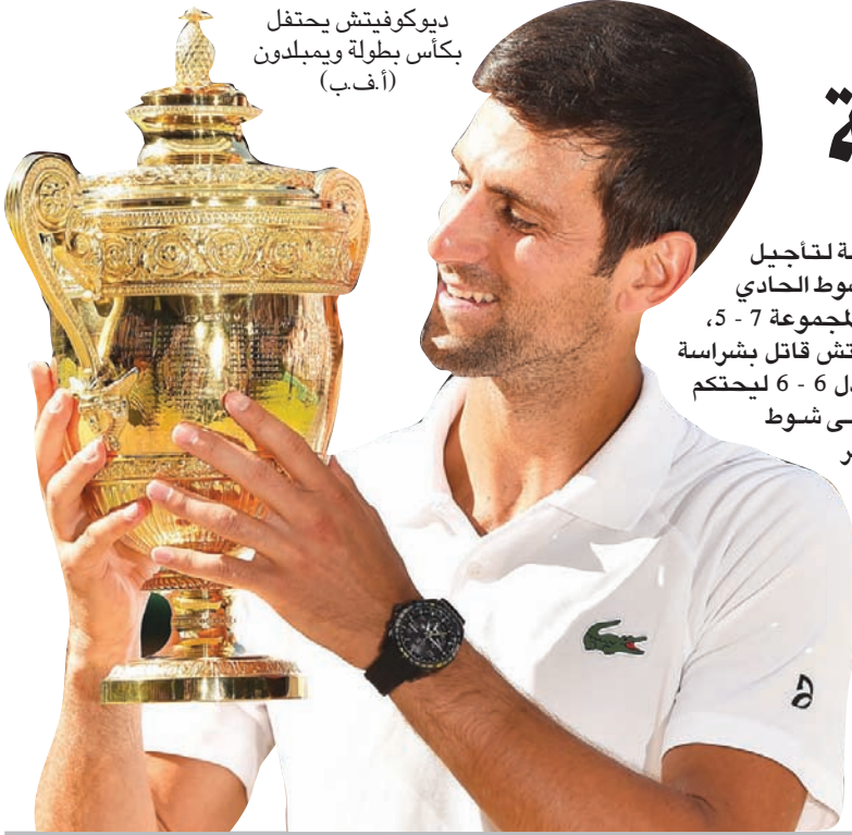
ديوكوفيتش يحتفل بكأس بطولة ويمبلدون

فرصة ذهبية لتاجيل الحسم في الشوط الحادي عشر وحسم المجموعة 7 - 5، لكن ديوكوفيتش قاتل بشراسة وأدرك التعادل 6 - 6 ليحتكم اللاعبان إلى شوط فاصل سيطر عليه الصربي تماماً وحسمه 7 - 3، منهيًا المجموعة في ساعة و 8 دقائق والمباراة في 20 ساعة و 20 دقيقة.