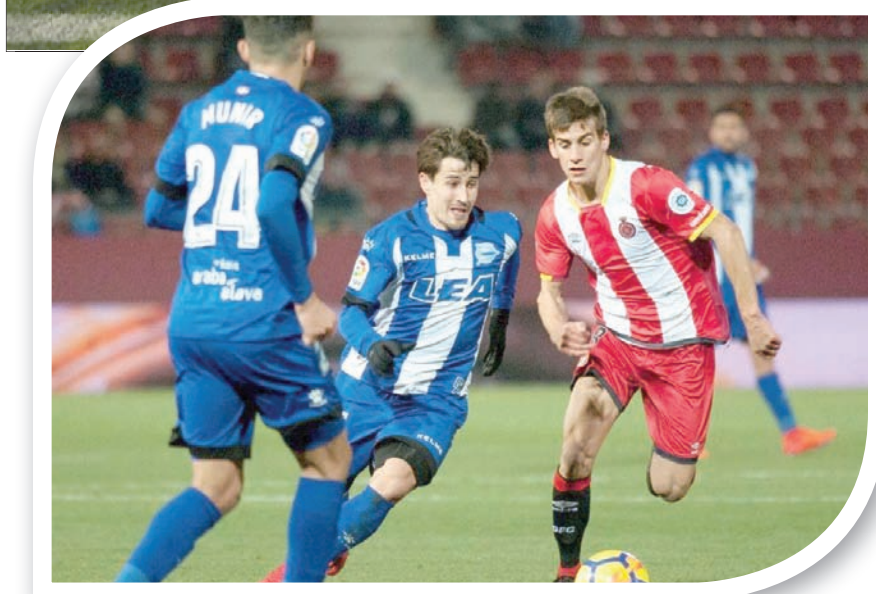
كركييتش يلعب الآن في صفوف ديبورتيفو أوفيس الإسباني

يقول كركيتش: «لقد حدث كل هذا بسرعة شديدة. فيما يتعلق بقواعد كرة القدم، فقد سارت الأمور بشكل جيد، لكن لم تكن كذلك على المستوى الشخصي بالنسبة لي؛ إذ كان يتعين علي أن أتكيف مع ذلك، ويقول الناس إن مسيرتي لم ترتق إلى حجم التوقعات والأمال. عندما بدأت اللعب بدأ الجميع يصفونني بأنني ميسي الجديد. حسناً، إنه لأمر جيد أن تقارن بنجم كبير مثل ميسي، لكن ما الشيء الذي توقعه مني في عالم كرة القدم؟». وأضاف: «هناك الكثير من الأشياء التي لا يعرفها الناس. أنا لم أشارك مع منتخب إسبانيا في نهائيات كأس الأمم الأوروبية عام 2008 بسبب مشكلات تتعلق بشعوري بالقلق، لكننا أخفينا ذلك وقتلنا إنني سأنهض في عطة. وقد استدعيت للانضمام إلى قائمة منتخب إسبانيا لمواجهة فرنسا في أول مشاركة دولية لي، لكنني تعرضت لنوبة قلق جديدة وقتلنا إنني مصاب بالتعب في المعدة. لكن لا أحد يريد أن يتحدث عن ذلك، وكرة القدم لا تبالي