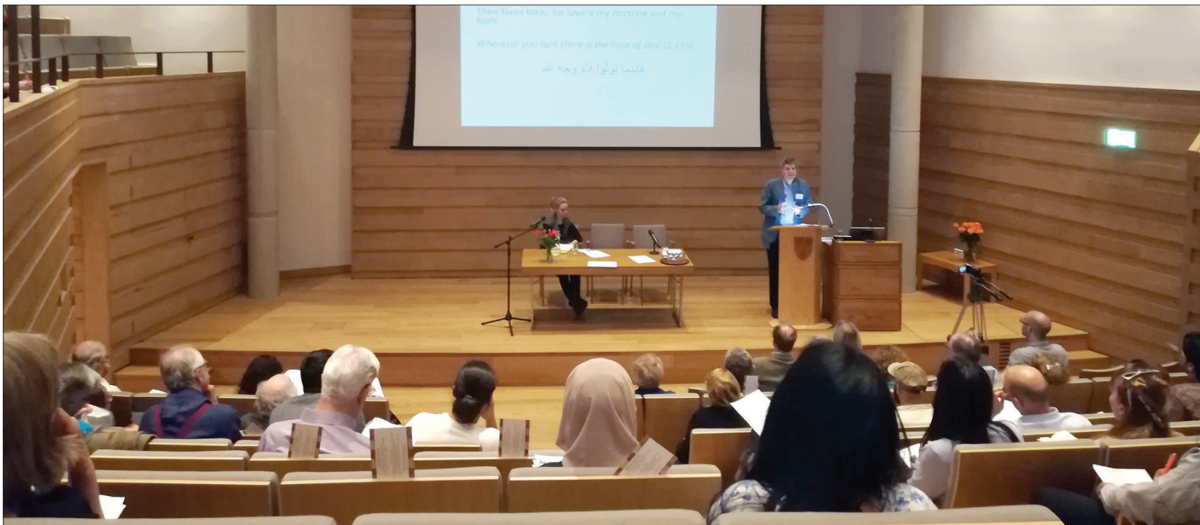
جانب من الندوة

تخصي الورقة التي قدمها البروفسور ستيفان شبيرل القدرة التي تمتلكها هذه القصيدة في التأثير على المتلقي رغم أن كل بيت شعري قائم في ذاته ويترك أثراً لوحده، فرغم غياب الخيط السردي للقصيدة نتجح في التأثير على المتلقي عبر الطريق هذا بفضل اللغة العربية نفسها، وبفضل الموروث الشعري الكلاسيكي الذي ما زال الأكاديميون المستعربون والمستشرقون المعينون بالأدب العربي منجذبين إليه وحريصين على إعادة نقله بمعالجات عصرية بينما يكرس آخرون جهودهم لتفكيك السحر الذي يجدونه في الموروث الشعري العربي الكلاسيكي وتسلط الضوء عليه كما وجدنا في هذه الندوة.