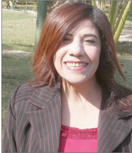
المؤرخ عاصم الدسوقي