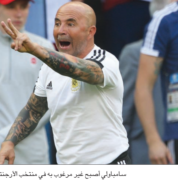
سامباولي أصبح غير مرغوب به في منتخب الأرجنتين

أجل الحصول على فرصة لتتفيذ مشروع طويل الأجل في الكرة المحلية. ورغم أنه اعترف بارتكاب بعض الأخطاء في روسيا، طالب المدرب الأرجنتيني بمنحه بعض الوقت لتطوير خطته، حتى لا يتعرض المنتخب الوطني مرة أخرى للتغيير على مستوى المونديال بعد حلولها ثانية في إدارته فنياً خلال السنوات الـ12 الأخيرة. لكن الانتقادات التي انهالت على رأس سامباولي بعد هذا الخروج المفاجئ، وانتهامه بعدم قدرته على خلق حالة من الاستقرار بالفريق، الذي لم يخض أبداً من المباريات الـ15 التي قاده خلالها منذ توليه منصبه (حزيران) 2017 بالثبوتية نفسها من اللاعبين. وتسلم سامباولي مهامه مطلع يونيو 2017، وقاد