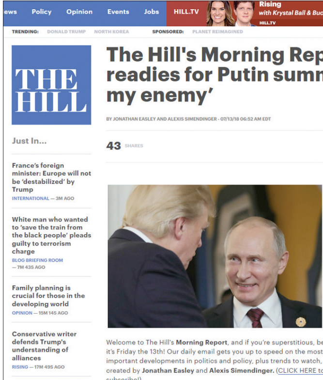
«ذا هيل»: ترشح ألا يطالب ترمب أي شيء من بوتين