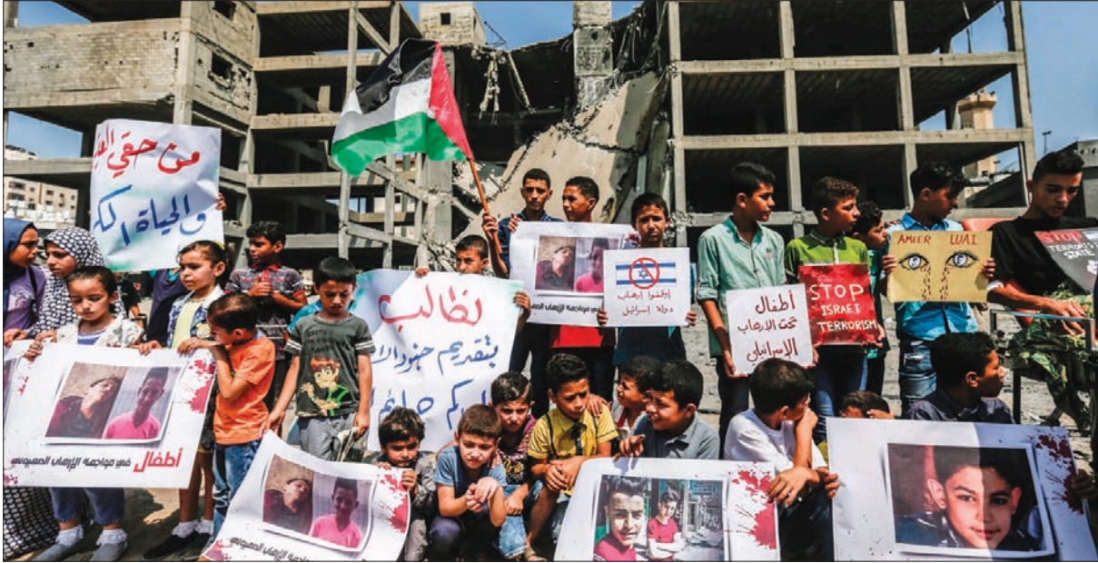
شباب وأطفال يتظاهرون رافعين العلم الفلسطيني أمام مبنى في غزة تعرض للكصف الإسرائيلي

صمدت تهددة أخرى توصلت إليها مصر بين الفصائل الفلسطينية وإسرائيل في قطاع غزة، لكنها بدت هشة، مع خلاف حول ما إذا كانت تشمل الطائرات الورقية والبالونات الحارقة. وساد الهدوء في غزة ومحيطها، منذ حرب صيف 2014 التي استمرت 51 يوماً.