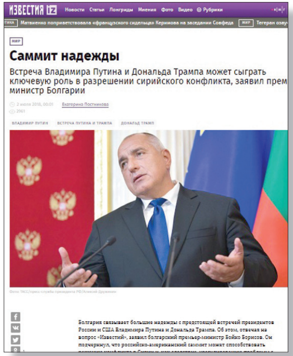
«إزفستيا» تستعين بمتحدث ثالث لعرض الآمال من القمة

على الجانب الآخر، لا يمكن تجاهل رغبة كبيرة لدى الجانب الروسي بأن تساهم قمة بوتين - ترمب على أقل تقدير في إطلاق حوار بين البلدين وتفعيل قنوات الاتصال التي ما زالت مجمدة منذ عام 2014، مقرر من إدارة أوباما. وفي تقرير بعنوان «قمة الأمل»، نشرت صحيفة «إزفستيا» الروسية حواراً مع رئيس الوزراء البلغاري بويكو بوريسوف، تناول بصورة خاصة التوقعات لنتائج قمة هلسنكي، وقال فيه، إن «بلغاريا تعلق آمالاً كبيرة على قمة الرئيسين بوتين وترمب»، وأضاف «اعتقد حقيقة أن القمة من شأنها أن تساعد في إيجاد وسائل لنسوية المسألة السورية، وهو ما سيساهم في الحد من موجة اللجوء إلى أوروبا».