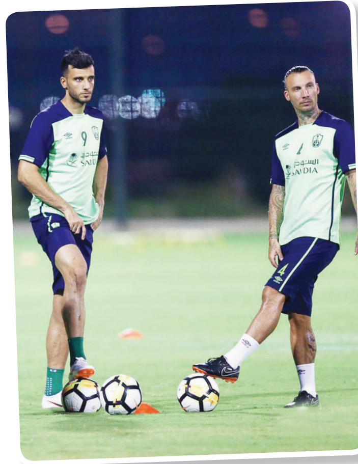
لاعبو الأهلي في تدريباتهم الأخيرة