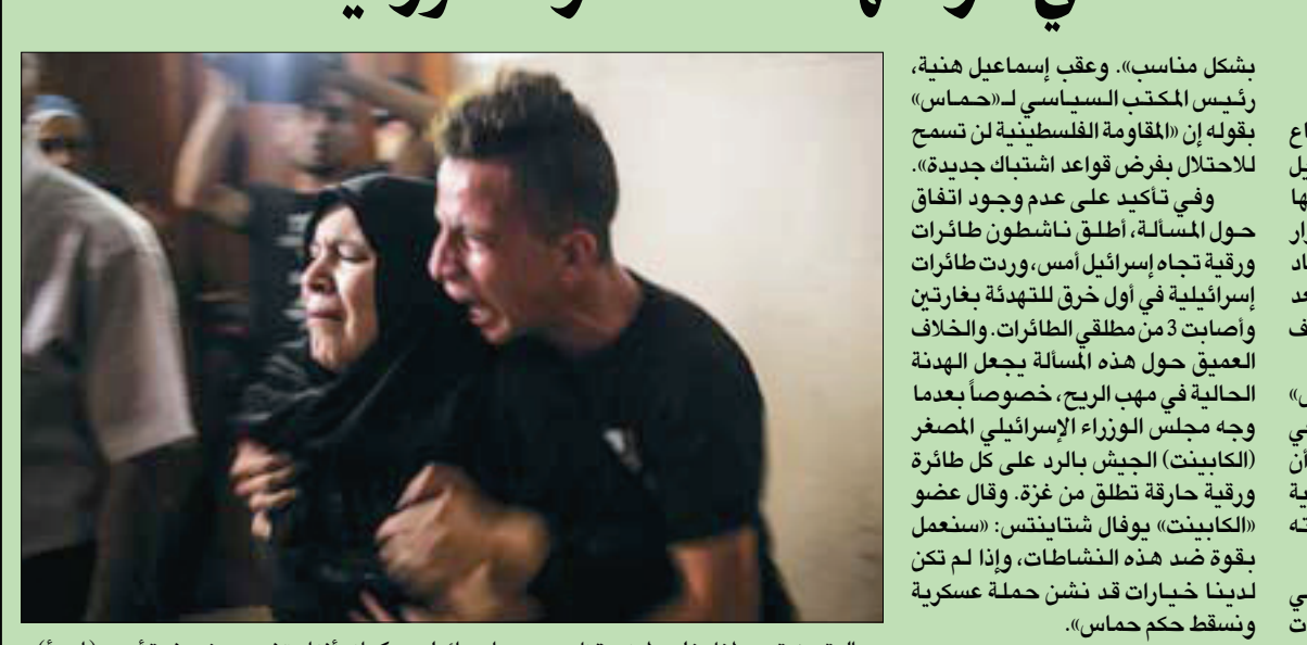
والدة وشقيق طفل فلسطيني قتل بهجوم إسرائيلي بيكيته أثناء تشييعه في غزة أمس

بشكل مناسب». وعقب إسماعيل هنية، رئيس المكتب السياسي لـ«حماس» بقوله إن «المقاومة الفلسطينية لن تسمح لاحتلال يفرض قواعد اشتباك جديدة». وفي تأكيد على عدم وجود اتفاق حول المسألة، أطلق ناشطون طائرات ورقية تجاه إسرائيل أمس، وردت طائرات إسرائيلية في أول حرق للمتهددة بغازات وأصاب 3 من مطلق الطائرات. والخلاف العميق حول هذه المسألة يجعل الهدنة الحالية في مهب الريح، خصوصاً بعدما وجه مجلس الوزراء الإسرائيلي المصغر (الكابينة) الجيش بالرّد على كل طائرة ورقية حارقة تطلق من غزة. وقال عضو «الكابينة» يوفال شتاينتنس: «سنعمل بقوة ضد هذه النشاطات، وإذا لم تكن لدينا خيارات قد نشن حملة عسكرية ونسقط حكم حماس».