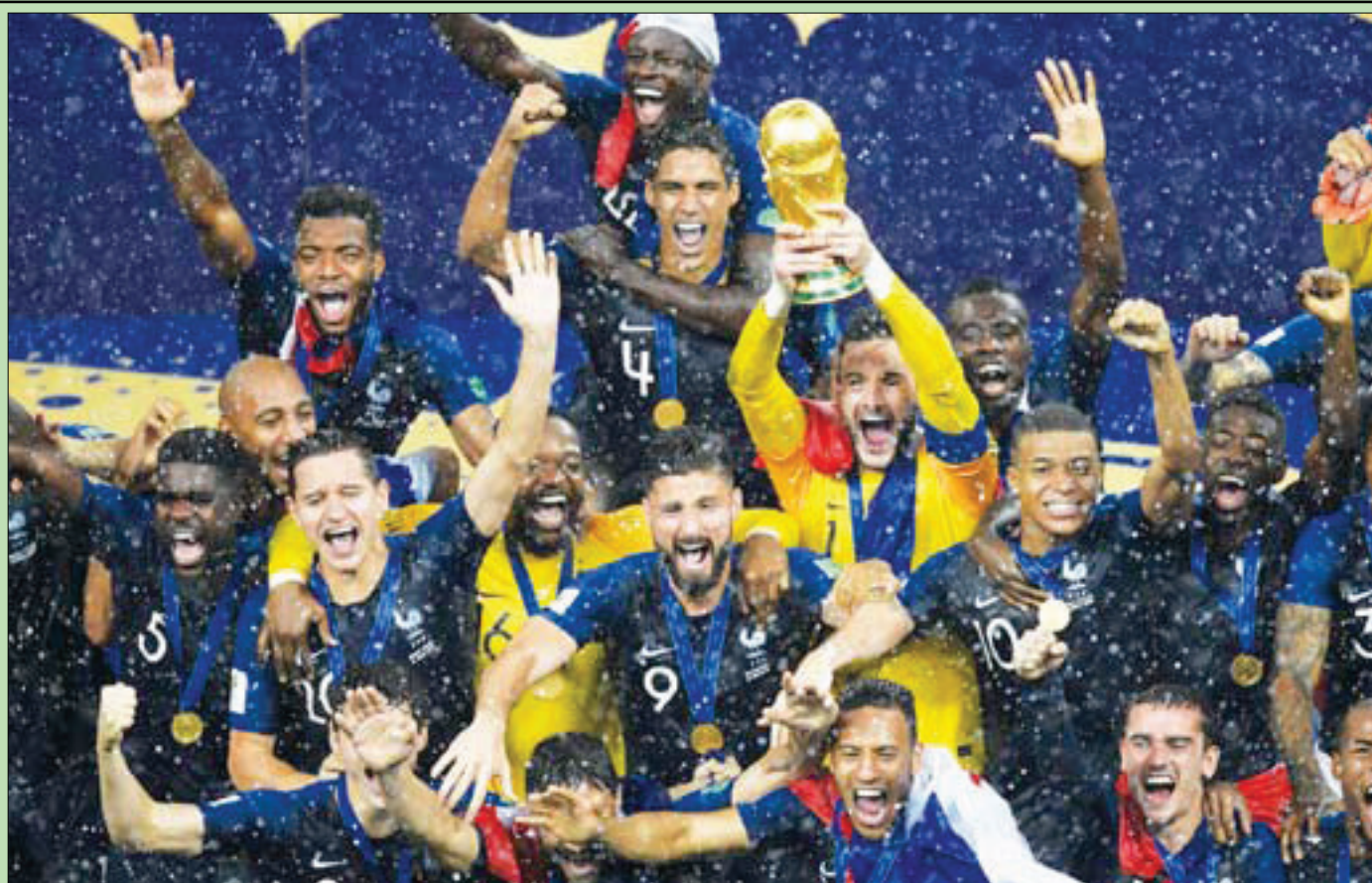
حارس مرمى المنتخب الفرنسي هوغو لوريس يحمل وسط زملائه كأس العالم بعد التتويج في موسكو أمس