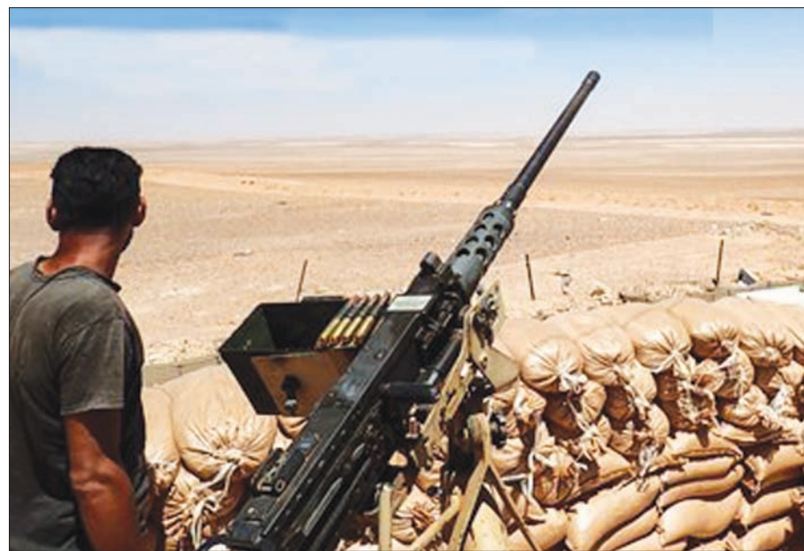
«جيش مغاوير الثورة» المدعوم أميركياً نشر صورة على حسابه تظهر مراقبته تخوم منطقة ال55 كم قرب مخيم الركيان لحمايته من «داعش»

إطلاق النار ينص على تسليم الفصائل سلاحها الثقيل ودخول مؤسسات الدولة إلى مناطق سيطرتها تدريجياً وإجلاء المقاتلين الراضين للتسوية إلى محافظة إدلب في الشمال السوري.