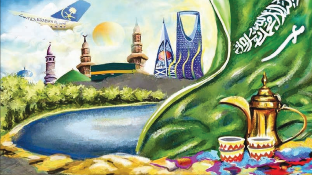
عمل للفنان السعودي أحمديني أحمد