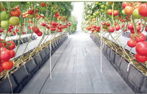
جدة، الشرق الأوسط

تواجه السعودية وكثير من دول المنطقة تحديات كبيرة فيما يتعلق بالموارد المائية. وما يفاقم المشكلة ندرة المياه العذبة والطلب المرتفع عليها من قبل القطاع الزراعي، حيث يستهلك هذا القطاع أكثر من 84 في المائة من مجمل أوجه الاستهلاك المائي في السعودية. كما أن عملية تحلية مياه البحر تعد باهظة التكلفة في حين أن ثمة حاجة لخفض التكاليف المتعلقة بالري.