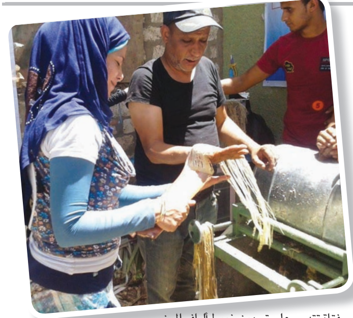
فتاة تتدرب على تجهيز خيوط الياف الموز

البحث العلمي ومعاهد اللغة في المدينة، حسناً ما أكده الملحق الثقافي الدكتور عبد العزيز المقوشي. وأضاف الملحق الثقافي في بريطانيا، أنه تم الإعداد للبرنامج لأن يغطي المدن والأقاليم البريطانية كافة بالتنسيق مع أندية الطلبة السعوديين في المملكة المتحدة والذي ستشهد بلفاست عاصمة أيرلندا الشمالية انطلاقته، مؤكداً أنه روعي في الإعداد للبرنامج التركيز على محورين رئيسيين: التوقف على أوضاع الطلبة المتبعثين، والعمل معهم على استثمار فرصة الابتعاث بما يتوافق مع الاحتياجات الجديدة للمملكة العربية السعودية المحددة في «رؤية المملكة 2030». من خلال