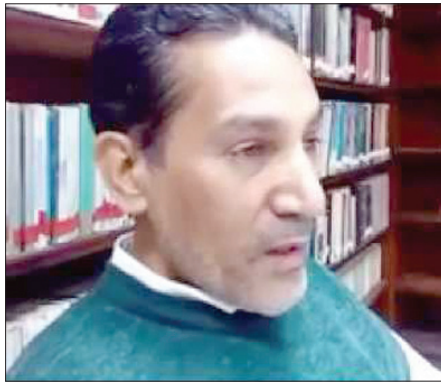
الشاعر السيد جلال