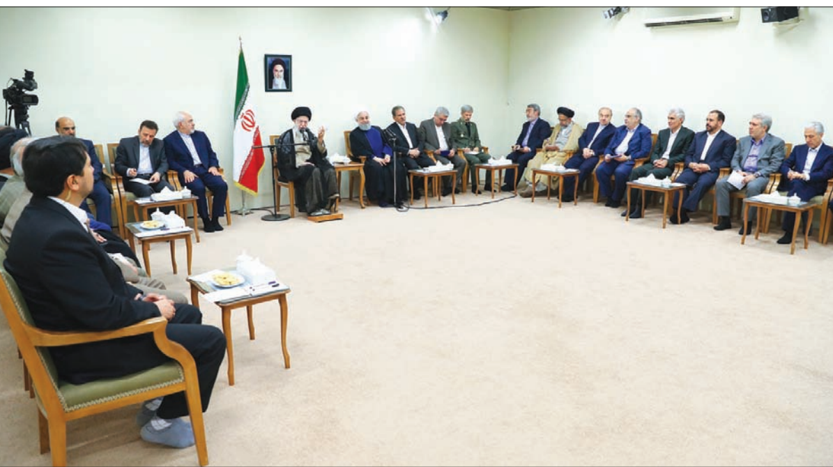
صورة نشرها موقع المرشد الإيراني لاجتماعه بأعضاء الحكومة في مقر إقامته وسط طهران أمس

على بعد نحو 10 أيام من بدء العقوبات الأميركية، استدعى المرشد الإيراني علي خامنئي، أمس، الرئيس حسن روحاني وفريقه الحكومي على خلفية «اضطرابات اقتصادية» تشهدها إيران، مطالباً إياه بتقديم خريطة طريق لخبات الوضع الاقتصادي، بموازاة مطالب حول خطوات ضد تفشي الفساد في سوق العملة والذهب.