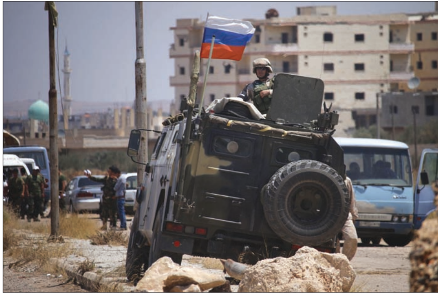
جندي روسي على مدرعة يراقب عملية الإجلاء في درعا