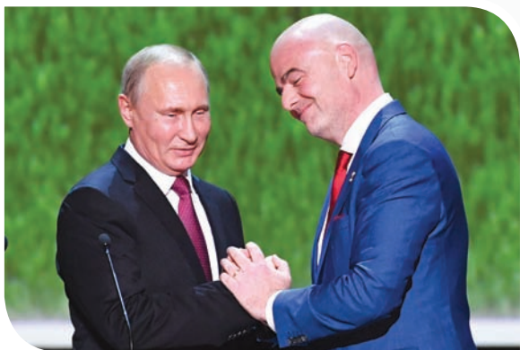
إنفانتينو رئيس الفيفا يهنئ بوتين على حسن التنظيم

على سبيل المثال، كرة القدم في كرواتيا تعاني مشكلات في البنية التحتية وسياسية. داليتش نفسه تولى منصبه قبل مباراة من نهاية التصفيات الأوروبية المؤهلة (قاد الفريق إلى المحق وتاهل على حساب اليونان)، لكن بفضل تأثيره ووجود بعض اللاعبين الجيدين تمكن المنتخب الكرواتي من الذهاب بعيدا في البطولة.