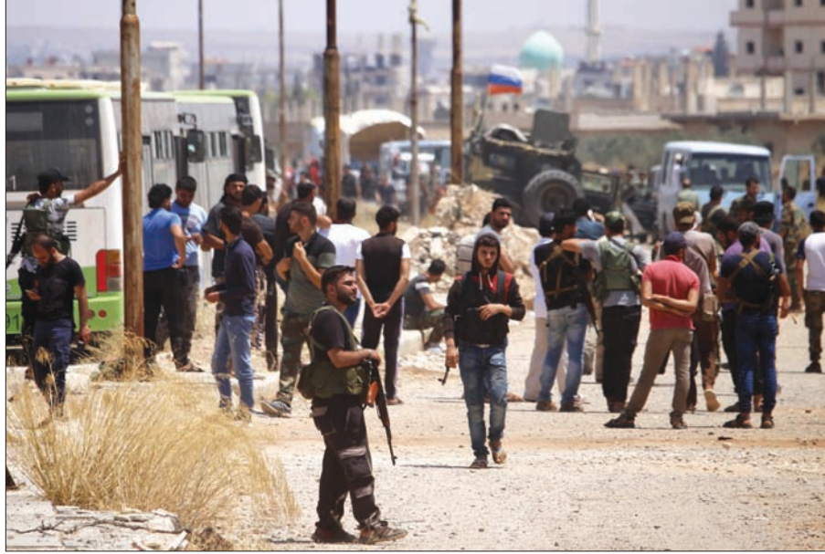
مقاتلون من الفصائل المعارضة بدرعا قرب الحافلات التي ستقلهم إلى الشمال السوري

وذلك نتيجة الاتفاق الذي ينص على خروج كل الفصائل على اختلاف توجهاتها». معتبراً أن موسكو ستكون في المرحلة المقبلة أمام امتحان الالتزام بتعهداتها عبر إبعاد الفصائل التابعة لإيران في مرحلة أولى عن حدودها وإخراجها من سوريا في مرحلة ثانية وهو ما يبدو صعب التحقيق بعد قبول إسرائيل ببقاء قوات النظام فقط على حدودها. في موازاة ذلك، بدأ مقاتلو الفصائل المعارضة وعائلاتهم، أمس، الخروج من مدينة درعا في جنوب سوريا تنفيذاً لاتفاق ينص على