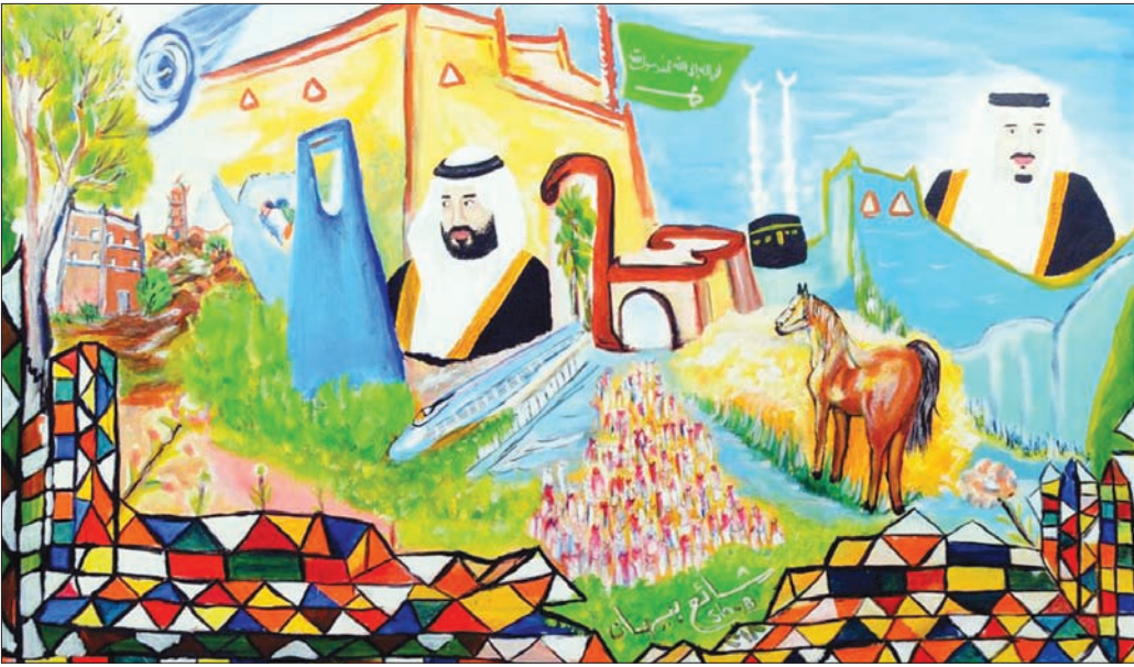
عمل للفنان السعودي شابع بيهان