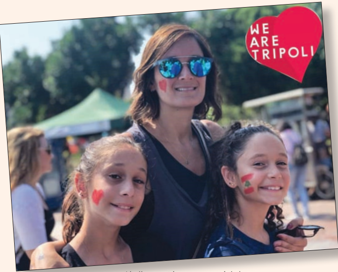
طرابلس تستعد لاستقبال المغتربين