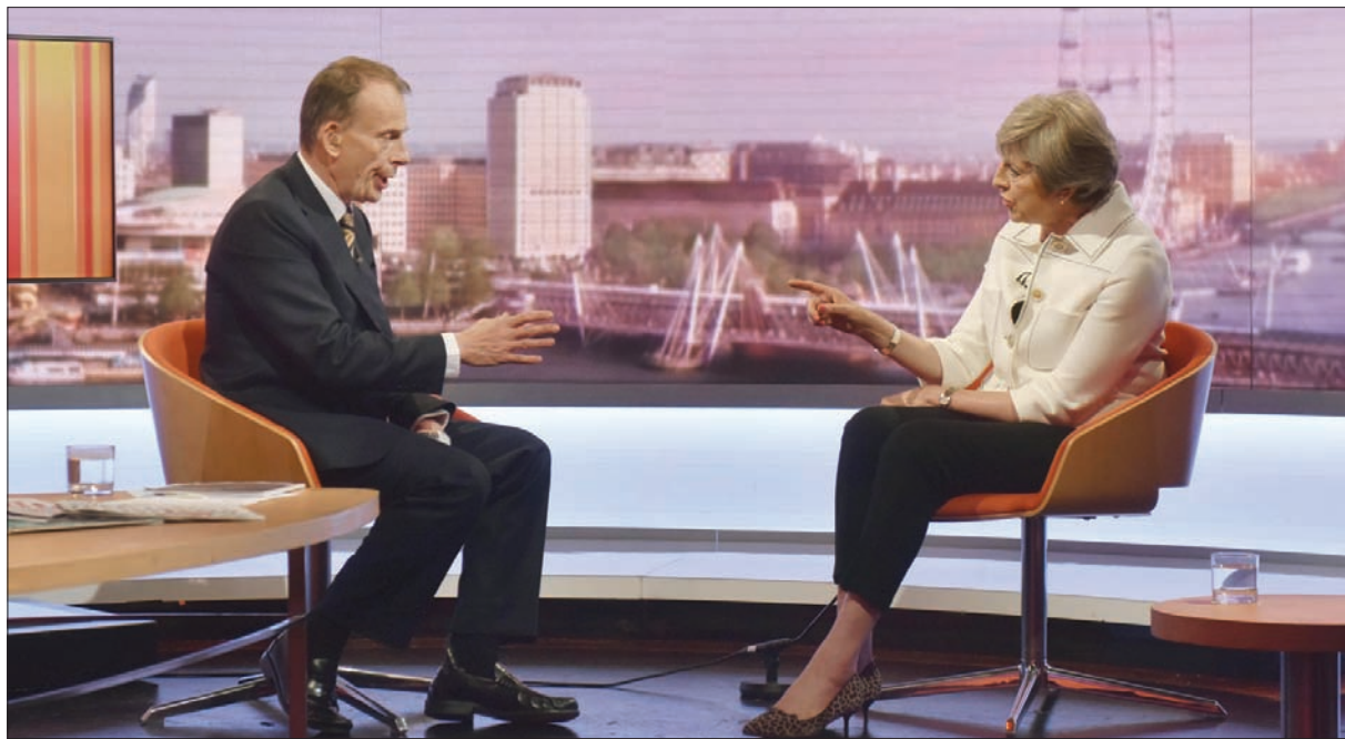
تيريزا ماي خلال مقابلتها مع أندرو مار أمس (رويترز)

صحيحة «ميل أون صندي» أمس. والتقى ترمب الملكة الجمعة في قصر وندسور خلال زيارته التي استمرت أربعة أيام لبريطانيا، وتجاوز خلاله الجروتوكول عدة مرات. وقال ترمب للمعلق التلفزيوني بيرس مورغان، في مقابلة خاصة، إنه ناقش مع الملكة مسألة خروج بريطانيا من الاتحاد الأوروبي. وقال ترمب إن الملكة «قالت - وهي محقة في ذلك - إنها مشكلة معقدة للغاية، أعتقد ألا أحد كان يتخيل كم ستكون معقدة». وأضاف أنه قال لـ«ماي إن لندن أن تحصل على «استفتاء» حول «بريكست» من الاتحاد الأوروبي، بحيث يمكنها فيما بعد إبرام اتفاق تجاري شامل مع الولايات المتحدة. ورغم الخلافات مع ترمب، تأمل ماي في التوصل سريعاً إلى مثل هذا الاتفاق بعد مغادرة «ما قاله الرئيس أيضاً أثناء المؤتمر الصحافي هو أنه يجب عدم التخلي عن المفاوضات، لا تنسحبوا من المفاوضات لأنكم عندهم ستعلقون»، مكررة رغبتها في التفاوض مع بروكسل من أجل الحصول على «أفضل اتفاق» ممكن قبل الخروج من الاتحاد. على صعيد متصل، كشف ترمب بدوره عن مجريات لقائه الخاص مع الملكة إليزابيث الثانية، التي نقل عنها قولها «مشكلة معقدة للغاية» في مقابلة نشرتها