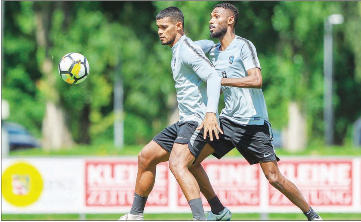
من تدريبات الهلال في النمسا