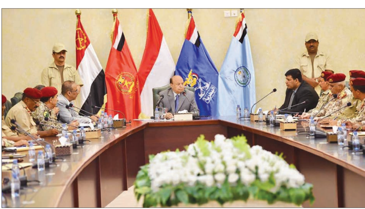
الرئيس اليمني لدى ترؤسه اجتماعاً مع القيادات العسكرية في عدن

إبطال الجيش الوطني لمواجهة قوى التمرد والانقلاب ويسطرون الملاحم ويصنعون الانتصارات ويقدمون التضحية رخيصة في سبيل الوطن. وقال: «لهم منا كل التاجر وسنولي الرعاية الكاملة لأسرة الشهداء والجرحى الذين قدموا كل ما يملكون دفاعاً عن الأرض والعرض».