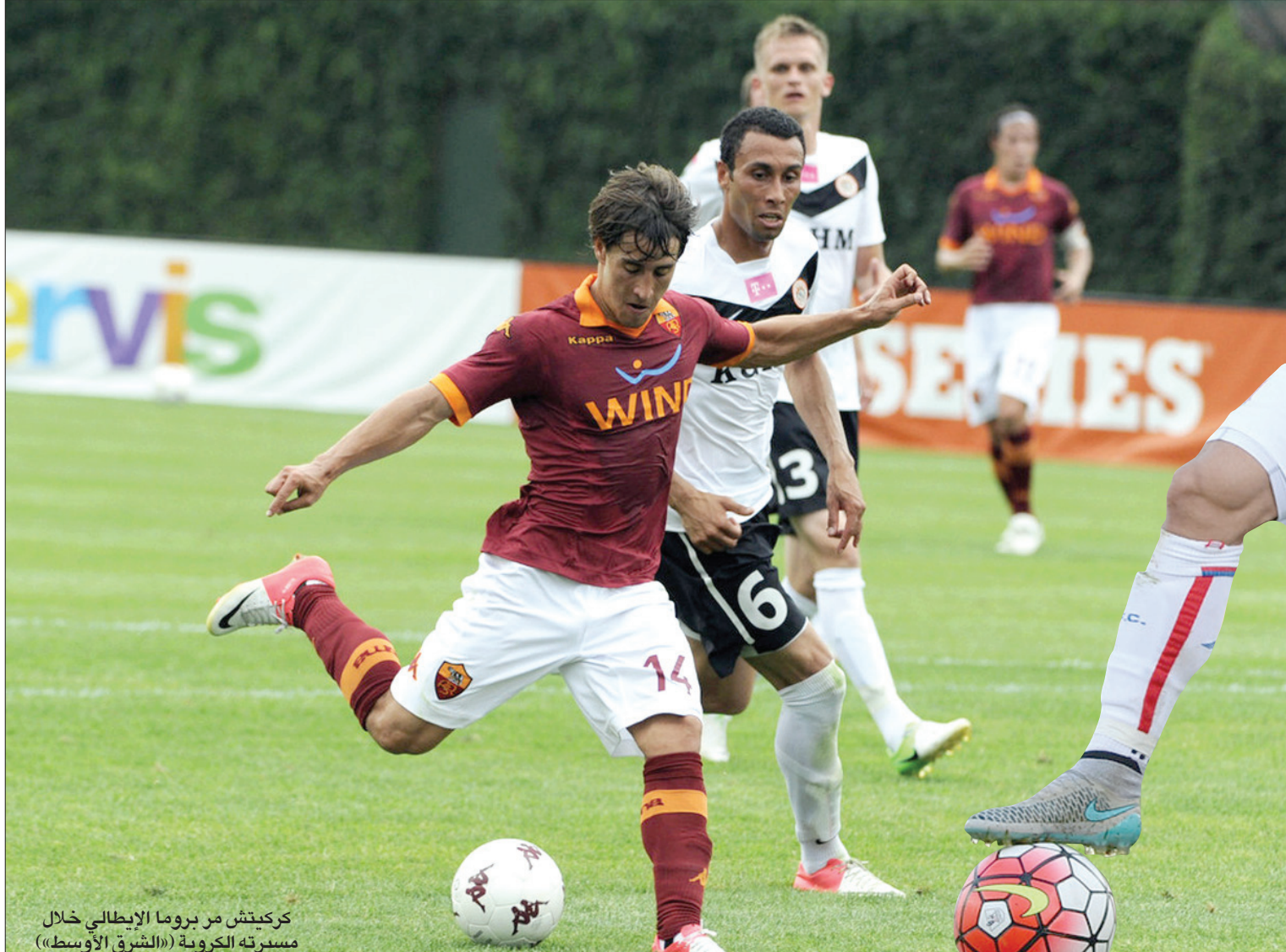
كركييتش مع بروما الإيطالي خلال مسيرته الكروية