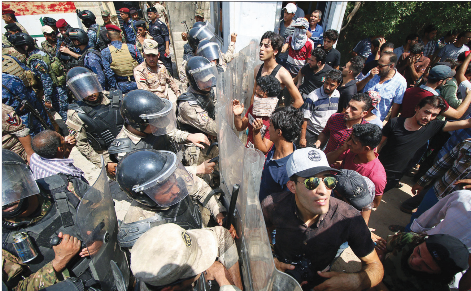
قوات الأمن في مواجهة متظاهرين أمام مبنى حكومي في البصرة أمس (رويترز)

بغداد، «الشرق الأوسط» قتل شخصان، وجرح عشرات، في الاحتجاجات ضد تفشي الفساد التي امتدت في جنوب العراق، ودخلت أسبوعها الثاني، أمس، وسط محاولات لاقتحام مقرات إدارية وحقل النفط، رغم إعلاء الحكومة إجراءات تنموية لاحتواء الاضطرابات. وقال مسؤول أمني إن اثنين من المحتجين قتلوا في اشتباكات مع قوات الأمن العراقية في بلدة السماوة، أمس، وأضاف لوكالة «رويترز» أن «مئات الأشخاص حاولوا اقتحام مبنى محكمة. جرى إطلاق النار علينا، لم يتضح من الذي يطلق النار. لم يكن أمامنا أي خيار سوى إطلاق النار». وحاول متظاهرون اقتحام مبنى محافظة البصرة، في وسط المدينة، لكن الشرطة فرقتهم بواسطة قنابل الغاز المسيل للدموع، بحسب وكالة الصحافة الفرنسية. وتصدت قوات الأمن لاحتجاجات على بعد نحو 4 كيلومترات من حقل الزبير النفطي، الذي تديره شركة «إيني»، قرب البصرة. وقالت مصادر في الشرطة إن 40 شخصاً أصيبوا، 3 منهم برصاص حي. وأفاد مسؤولون محليون بأن الاحتجاجات لم تؤثر على إنتاج النفط في مدينة البصرة، التي تدر صادرات النفط منها أكثر من 95 في المائة من عائدات العراق. ومن شأن أي تعطيل للإنتاج أن يخلق ضرراً شديداً بالاقتصاد المتعثر، ويقود أسعار الخام العالية للارتفاع. وانطلقت مظاهرات في البصرة لليوم الثامن على التوالي