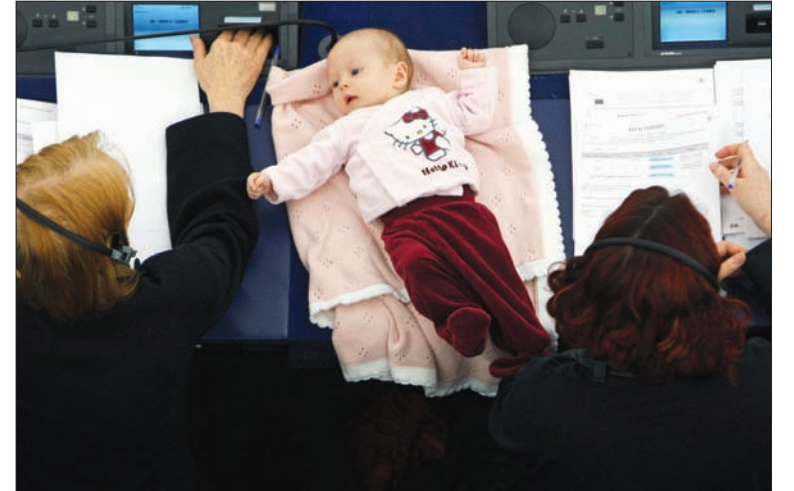
عضو البرلمان الدنماركي هاني داهل تشارك مع طفلها في جلسة تصويت في البرلمان الأوروبي في ستراسبورغ