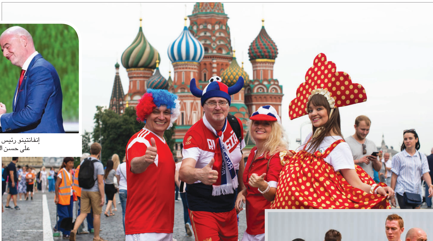
الساحة الحمراء، في وسط موسكو كانت مركزاً للاحتفالات وملتقى لجمامير المونديال

لقد أعطت كرواتيا الأمل للدول الصغيرة التي تتطلع لحكاية النجاح في كأس العالم، وخصوصا مع دخول البطولة مرحلة جديدة بإقامة نهائيات النسخة 22 في قطر بين نوفمبر (تشرين الثاني) وديسمبر (كانون الأول) 2022 ويقول مدرب كرواتيا زلاتكو داليتش: «بالنسبة لي، ميسي هو أفضل لاعب في العالم، ونيمار قريب جدا منه من حيث الترتيب، وقد ودعت كل الفرق المدمجة بالنجوم، والتي اعتمدت بشكل حصري عليهم البطولة مبكرا وعادت إلى ديارها». وأضاف: «أما الفرق المدمجة والمتحدة، والتي حاربت من أجل شيء ما، فقد كان مشوارها أطول. وربما كانت هذه من أغرب النهائيات في تاريخ كأس العالم». وبدا أنه من غير المجدي، وخصوصا مع الاقتراب من الختام، أن يضع بلد ما خططا طويلة الأمد لتحقيق النجاح.