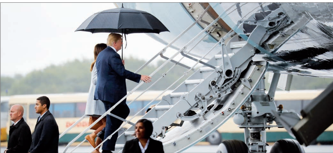
ترمب وميلانيا لدى مغادرتهما غلاسكو إلى هلسنكي أمس

للقرصنة، لكنها لم تنشر، نافيًا وجود أي مؤشر على تعرض الحزب الجمهوري للقرصنة خلال حملة ترمب الانتخابية. من جهة أخرى، أكد ترمب لشبكة «سي بي إس» أنه لا ينتظر «الكثير» من قمته مع بوتين. لكنه دافع عن قراره لقاء الرئيس الروسي رغم انتقادات المعارضة الديمقراطية، وقال في المقابلة: «أؤمن بشهدة أن 2016، لن تبقى نعمة علاقة، بين واشنطن وموسكو».