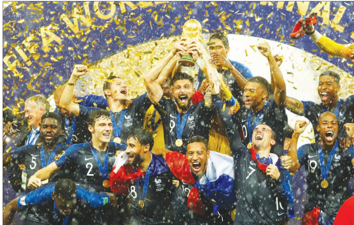
لاعبو المنتخب الفرنسي يحتفلون بالتتويج أبطالاً للعالم

لكن بيرسييتش تحول من بطل إلى شرير عندما كان المستبقي في ركلة جزاء مثيرة للجدل احتسبها الحكم الأرجنتيني نيبستور بيتانا بعد الاستعانة بحكم الفيديو المساعد (فار) وسجل منها غريزمان هدف فرنسا الثاني وكان الأمر قاسيا على كرواتيا الذي ركضت أكثر من منافستها. وهي فرنسا على الفوز.