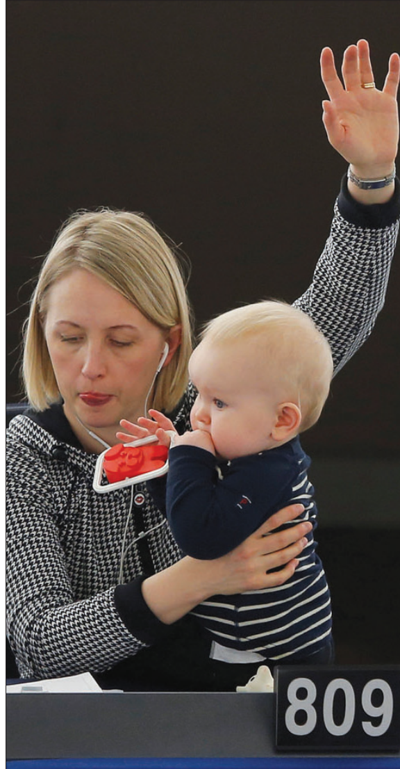
عضو البرلمان الأوروبي السويدية جيتي غوتلاند تحمل طفلها أثناء مشاركتها في جلسة تصويت