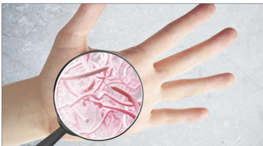
لندن، «الشرق الأوسط»

يؤدي أكثر السراق تمرسا جريمتهم ويسلمون من موقع الجريمة بخفة دون أن يشعر بهم أحد، ولكنهم في المقابل يتحركون خلفهم ملايين الشهود في مسرح الجريمة، كلها من الجرائم؛ وقد توصل العلماء إلى وسيلة تتيح تحديد هوية المجرمين بالاعتماد على الجراثيم التي تتساقط من الجلد والأظفار.