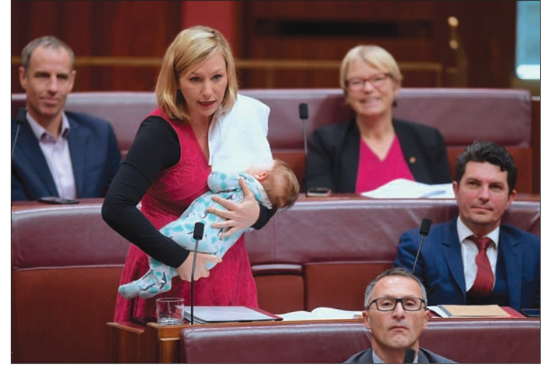
السيناتور الأسترالية لاريسا ووترز من حزب الخضر ترضع ابنتها في مبنى البرلمان في كانبيرا