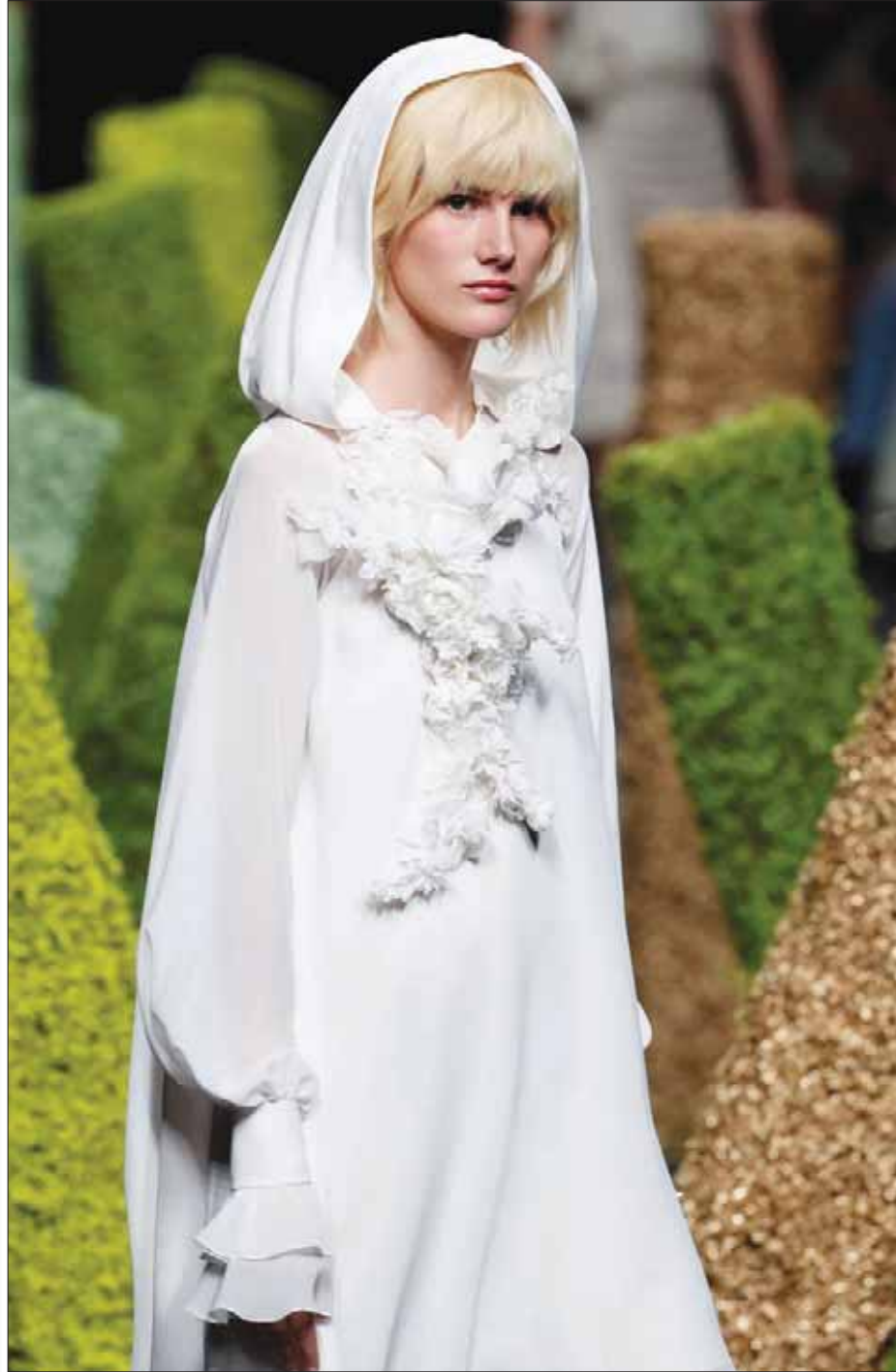
عارضة تقدم زياً في أسبوع مدريد للموضة أمس

من الحسن تذكرها اليوم، حتى نعلم أن طلبة اليوم في أميركا يتعاونون أرضاً سبغهم لها الأسلاف، ورحمة الله على البطلين ذيب وجاسر.