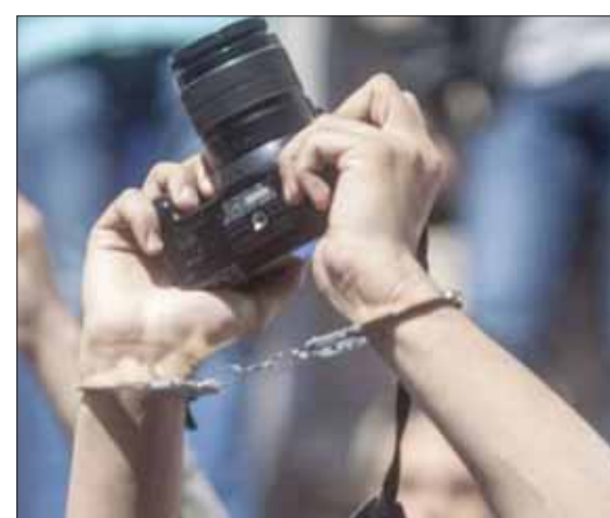
تونس احتلت المرتبة الـ 97 من أصل 180 دولة في مؤشر حرية الصحافة لعام 2018 الذي أعدته «اليونسكو»

المعارضة، لم تهضم بعد «مبدأ حرية الصحافة»، ولا تطري عليها إلا عندما تخدم مصالحها، وتشيد بإنجازاتها ومواقفها. أما إذا تعرضت الصحافة لأي طرف بالتقييم الموضوعي، على قاعدة «الخبر مقدس والتعليق حر»، فإن مختلف المسائل تنصب على من تجرأ وأعلن رأيه بكل صراحة.