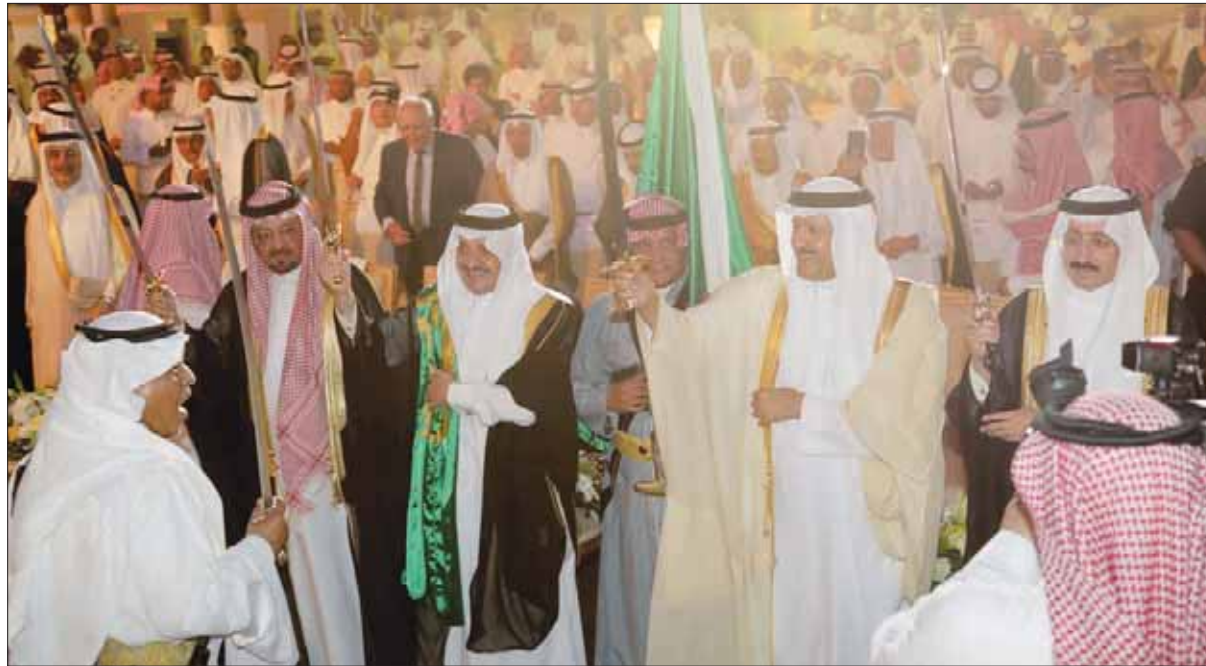
الأمير سعود بن نايف والامير سلطان بن سلمان شاركا أهالي الأحساء الفرحة بانضمامها إلى قائمة التراث العالمي

2050، مع ما تلزمه تلك الدراسات من المحافظة على أوساط المدن التاريخية، والمحافظة على الواحة الزراعية، وبعد تسجيل الأحساء، نواصل العمل جاداً في المحافظة على التراث وفقاً للالتزامات الفنية والبرنامج الزمني الذي تقدمت به المملكة في ملف الترشيح وخطة الإدارة، ووفقاً لخطوات ومواصفات هيئة التراث العالمي، وبالمستوى الذي يليق بالأحساء كموقع تراث عالمي، وبمساعدة الجهود الدائمة والدائمة للمهندس