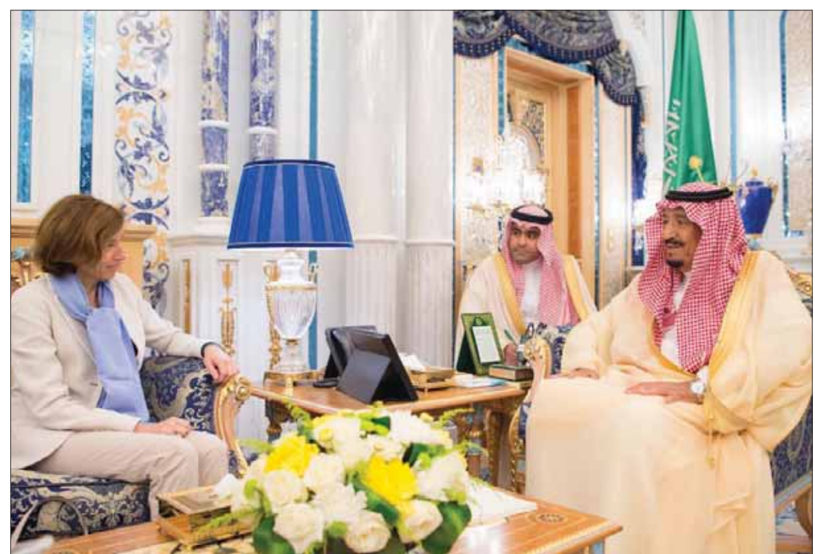
خادم الحرمين الشريفين لدى لقائه وزيرة الدفاع الفرنسية فلورانس بارلي في جدة أمس

بكين «الشرق الأوسط»، أكد الشيخ صباح الأحمد الصباح، أمير الكويت، أمس أن بلاده تتجه لإقامة شراكة استراتيجية مع الصين، داعياً بكين للعب دور فاعل في المساعدة على مواجهة التحديات الكبيرة في الإطار الخليجي والعربي. ووصل أمير الكويت أول من أمس إلى بكين، حيث يحل ضيف شرف «منتدى التعاون العربي - الصيني» الذي بدأ أعماله أمس. ومن المقرر أن تعقد الدورة الثامنة للاجتماع الوزاري للمنتدى في بكين غداً الثلاثاء، بحضور الرئيس شي جينبنغ، وأمير الكويت وممثل 21 دولة عربية، والأمين العام لجامعة الدول العربية. ومن المقرر أن يسفر الاجتماع الوزاري للمنتدى عن