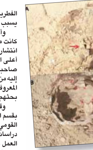
جمجمة المومياء التي كشفت عن أقدم إصابة بمرض الالتهاب السحائي

وأضاف في تصريحات لـ«الشرق الأوسط» أنّ «ما توصل له الفريق البحثي الإسباني قد يجعل التخصصيين يعيدون التفكير في وجود أنواع بكتيرية أخرى غير الشائعة الآن، والتي تسبب المرض».