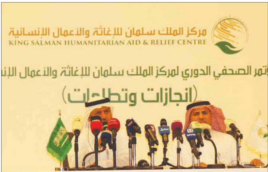
الجطيلي والمعلم لدى تحدثهما في مؤتمر صحفي عقد بالرياض أمس (الشرق الأوسط)

وتكر المعلم أن المركز يواصل رعاية الأطفال اليمنيين الذين تم تجنيدهم من قبل الميليشيا الانقلابية، مشدداً على استمرار المركز في تشغيل المستشفيات باليمن.