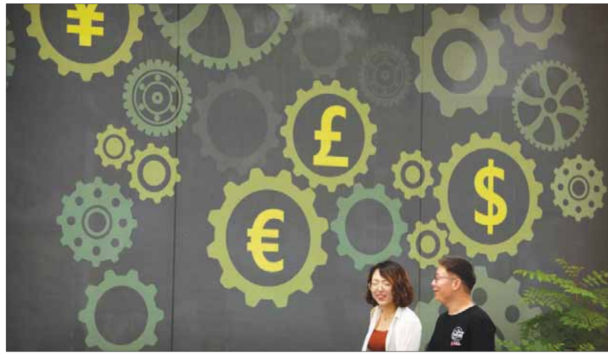
أصبحت الصين أكثر أهمية لبعض الدول الأوروبية في ظل الصعوبات مع الولايات المتحدة

وقال رئيس الحكومة، في خطاب في أثناء قمة بين بكين و16 دولة من وسط وشرق أوروبا، السبت، في صوفيا: «الانفتاح كان محركاً رئيسياً لبرنامج الصين الإصلاحية، وستواصل انفتاحنا بشكل أوسع على العالم، بما في ذلك منح وصول أوسع إلى السوق للمستثمرين الأجانب والمنتجات الأجنبية التي تلبى حاجات المستهلكين الصينيين».