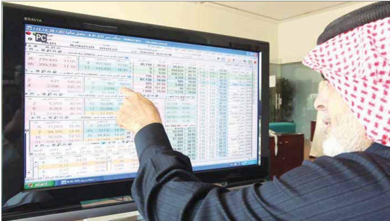
مستثمر يتابع أسعار الأسهم في البورصة السعودية.

بنحو 42,4 في المائة في الفترة نفسها من العام الماضي. إلى ذلك، أشاد صندوق النقد الدولي أخيراً بالإصلاحات الاقتصادية الإيجابية التي تعمل عليها السعودية، مؤكداً في الوقت ذاته أن تطبيق بعض المبادرات التي تستهدف زيادة الإيرادات غير النفطية يمثل إنجازاً بارزاً. ويأتي ذلك في الوقت الذي كشفت فيه أرقام التقرير الربعي للميزانية السعودية عن ارتفاع ملحوظ في الإيرادات غير النفطية خلال الربع الأول من عام 2018.