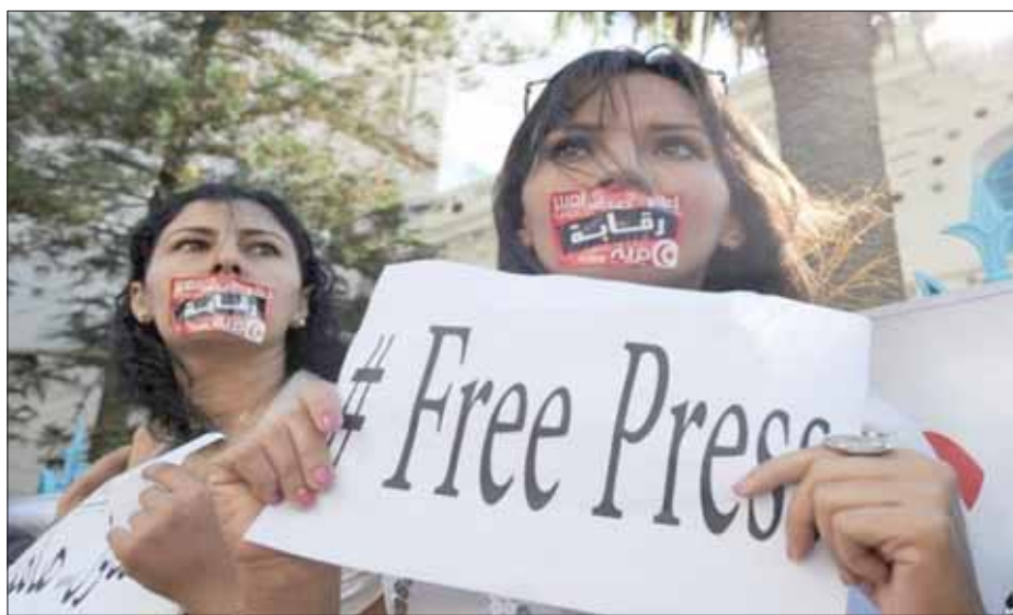
من اللقطات المتداولة بكثرة على مواقع التواصل الاجتماعي لمظاهرات حرية الصحافة في تونس

وفي هذا الشأن، يؤكد ناجي السبغوري، نقيب الصحفيين التونسيين، لـ«الشرق الأوسط»، وجود مخاوف حقيقية من الردة التي تهدد قطاع الصحافة، ويرى أن مكونات المشهد السياسي التونسي، من أحزاب سياسية مشاركة في الحكم أو في