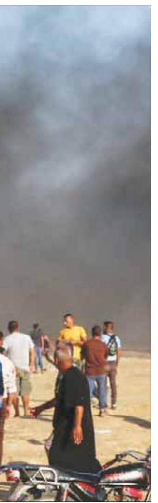
محتجون فلسطينيون يراقبون تساقط قذائف الغاز التي يطلقها الجيش الإسرائيلي عبر الحدود مع غزة

عزة، «الشرق الأوسط» قالت مصادر مقربة من حركة حماس، إن أي صفقة تعقد بين الحركة وإسرائيل، سواء بشأن تبادل الأسرى، أو ما يتعلق برفع الحصار عن قطاع غزة، بما في ذلك هدية قصيرة أو طويلة الأمد، ستكون برعاية الجانب المصري. وأوضحت المصادر لـ«الشرق الأوسط»، أن هناك اتصالات دائمة ومراسلات، تجري بين قيادة المكتب السياسي لحركة حماس والمسؤولين عن الملف الفلسطيني في جهاز المخابرات المصرية، حول العديد من القضايا. مشيرة إلى أن المسؤولين المصريين يتفهمون المطالب التي تضعها حماس كشرط لأي اتفاق مع إسرائيل. وبحسب المصادر، فإن الحركة أكدت للجانب المصري على شروطها بشأن أي صفقة تبادل أسرى، وأنه لا يمكن ربط قضية الجنود الإسرائيليين المعتقلين لديها، بأي حلول لا تشمل الإفراج عن السجناء الفلسطينيين، ولا يمكن لأي صفقة أن تنجز من دون الإفراج عن جميع الأسرى الذين أعادت إسرائيل اعتقالهم، بعد الإفراج عنهم في صفقة شاليط. ويبلغ عدد الأسرى الذين أعادت إسرائيل اعتقالهم وفرضت محكومات عالية بحقهم، أكثر من 86 فلسطينياً،