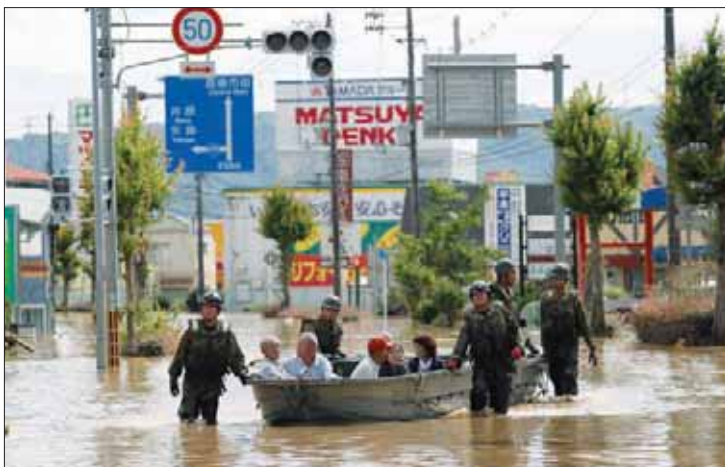
قوات يابانية تنقذ سكان منطقة غمرتها المياه

أشخاص كثيرين مفقودين، كما أن هناك آخرين بحاجة للمساعدة... إننا نتابع الزمن». ولغت السلطات تحذيرات الطوارئ من الأمطار الغزيرة بحلول المساء، لكن لا تزال هناك إرشادات بشأن هطول أمطار بدرجة أقل وكذلك حدوث انهيارات أرضية.