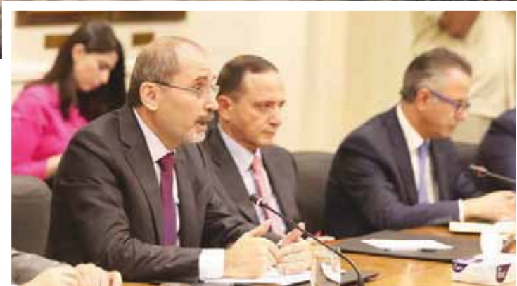
وزير الخارجية الأردني ناقش مع سفراء الاتحاد الأوروبي أمس الوضع في سوريا (أ.ب.)

الأردنية للقيام بذلك. وكان الأردن رفض فتح حدوده أمام النازحين، قائلاً إنه لم يعد قادراً على استيعاب المزيد من اللاجئين على أرضه، إلا أنه قدم مساعدات للنازحين قرب حدوده، ووفر مستشفيات ميدانيين لخدمتهم.