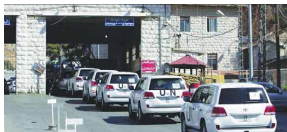
معبّر المصنع الحدودي بين لبنان وسوريا

الخاصة نظامية، في مركز الأمن العام السوري، فقدت المجموعة أحد أفرادها. اصطاده الموظف للخدمة العسكرية الإلزامية، «لأن الوطن بشكل حاجزاً كما قال رجل الأمن. ولم تنفع توسلات الزوجة كون زوجها قد تجاوز الأربعين. نهرها الرجل صرخ بها: «انفليعي ودعيه يخدم وطنه». فانتقلت وهي تولول. انتظار الحافلة التي شارك سائقها سلفاً في عملية التهريب استمر يومين في استراحة قرب مركز الأمن العام السوري. إلا أن سائقهم تركهم بصيرهم وعا إلى بيروت. وفي فجر اليوم الثالث عمد أفراد المجموعة إلى تدبير وسائل