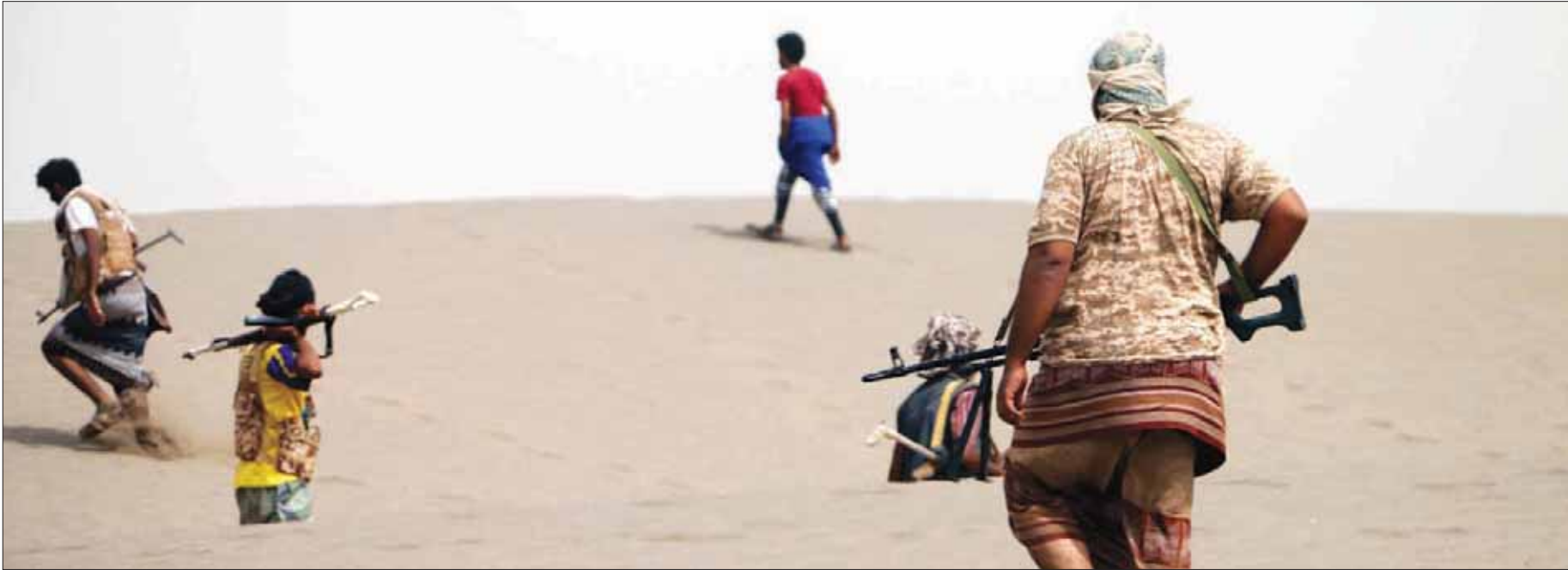
تعز، «الشرق الأوسط»