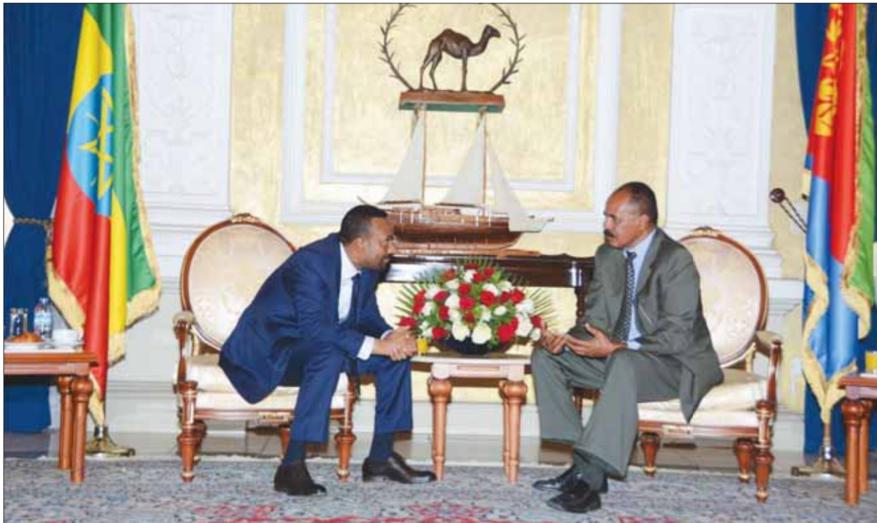
الرئيس الإريتري آسياس أفورقي ورئيس الوزراء الإثيوبي أبي أحمد في أسمره