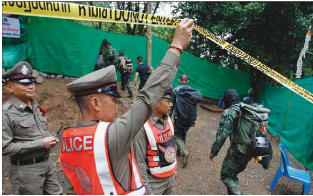
الشرطة تطلق المنطقة المحيطة بالكهف قبيل بدء عملية الإنقاذ الأولى أمس وتسمح للغواصين فقط بالدخول

القصة بدأت في 23 يونيو (حزيران) الماضي، عندما توجهت مجموعة من الأطفال (12 طفلاً)، مع مدربهم (25 عاماً)، بعد