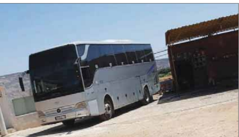
حافلة ركاب على طريق مقفر شرق لبنان تمهيداً لإنزال الركاب غير الشرعيين

يجيب مسؤول أممي بأن «تهريب البشر والبضائع والمنموعات عمره من عمر الحدود بين الدول. ونحن نحاول قدر المستطاع مع استحالة ضبط الحدود الشرقية مع سوريا والتي تمتد نحو 145 كلم، هذا عدا الحدود الشمالية. لكن هذه القضية تتطلب ضافراً جهود عدة، سواء لجهة صلب عمم مكاتب السفريات ومراقبتها، أو لجهة تسهيل الإجراءات المعقدة المفروضة على عمل المهربين الذين يستغلون الظروف الصعبة لمن يريد مغادرة لبنان، فليتفق المسؤولون وينظّموا هذا الملف وبعد ذلك يمكن للتعاون بين جميع الأطراف المعنية أن يثمر، لأن القبض على مواطنين سوريين عابدين وتوقيفهم لن يحل المشكلة. ويمتنع التسلل خلسة».