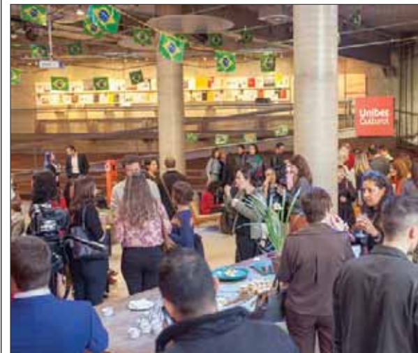
لقطة عامة من حفل الاستقبال

شرف الدورة الـ25 المعرض ساو باولو الدولي للكتاب التي تقام خلال الفترة ما بين 3 - 12 أغسطس (آب) المقبل، ستعد إمارة الشارقة، بإشراف هيئة الشارقة للكتاب، وبالتعاون مع 15 هيئة ومؤسسة ثقافية إماراتية، أكبر مشاركة عربية في مظاهرة ثقافية في أمريكا اللاتينية في وفد يضم 20 كاتباً وناشراً إماراتياً يقدمون سلسلة من الجلسات والندوات العرفية بالمعرض، إلى جانب 40 كاتباً إماراتياً منزهجاً في البرتغالية اللغة الرسمية في البرازيل.