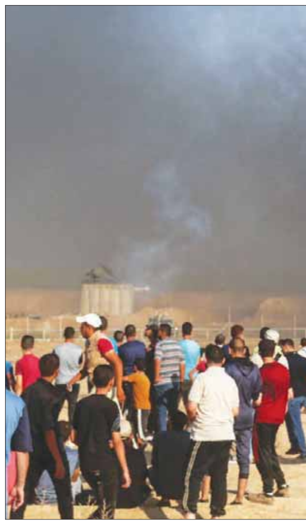
محتجون فلسطينيون يراقبون تساقط قذائف الغاز التي يطلقها الجيش الإسرائيلي عبر الحدود مع غزة

على الرغم من قرار محكمة العدل العليا بتجميد هدم بلدة الخان الأحمر الفلسطينية، شرعت قوات الاحتلال الإسرائيلي، أمس (الأحد)، بنصب بيوت مؤقتة (كرفانات) كبيرة في محيط مدينة القدس الشرقية المحتلة، وقرب بلدتي أبو ديس والعيزرية تحديداً، تمهيداً لتهجير أهالي الخان الأحمر وأبو الدوار. وحسب مصدر استيطاني رفيع، فإن هذه الخطوة تأتي في إطار الحملة الاستيطانية الواسعة التي تنفذها إسرائيل هذه الأيام، التي لا يوجد فيها اعتراض أميركي على أي شيء تفعله. وقال المصدر إن القرار الذي اتخذته اللجنة الوزارية لشؤون القوانين بالسماح للمستوطنين باحتلال أراض فلسطينية هو أيضاً ضمن هذه الخطة. وأضاف المصدر، المعروف بأنه قناة اتصال حارة بين المستوطنين ومكتب رئيس الوزراء الإسرائيلي بنيامين نتنياهو، أن «الحكومة تساند أي مشروع استيطاني في الضفة الغربية والقدس، وأنه يلمس أن نتنياهو نفسه معني بعودة المستوطنين إلى المستوطنات الأربع التي تم إخلاؤها قرب جنين، شمال الضفة الغربية، التي كانت قد أُخليت في إطار خطة الانفصال عن قطاع غزة في سنة 2004». وفي منطقة الخان الأحمر، قال شهود عيان إن قوات الاحتلال أغلقت كثيراً من الشوارع في بلدي العيزرية وأبو ديس، المفضية إلى قرية الخان الأحمر، فضلاً عن تحرك شاحنات ضخمة تحمل كرفانات كبيرة وتفرغها في