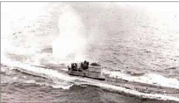
الغواصة الألمانية قبيل غرقها

وتمكن القسم الأكبر من طاقم الغواصة (نحو 50 فرداً) من النجاة والوصول إلى اليابسة، فيما توفي 8 من أعضاء الطاقم. وجاء في التقرير الألماني عن إغراق الغواصة: «بعد وهلة بدا الشعور بموجة الانفجارات الناجمة عن التفجير الناجح، ووضع الرجال جرف الساحل