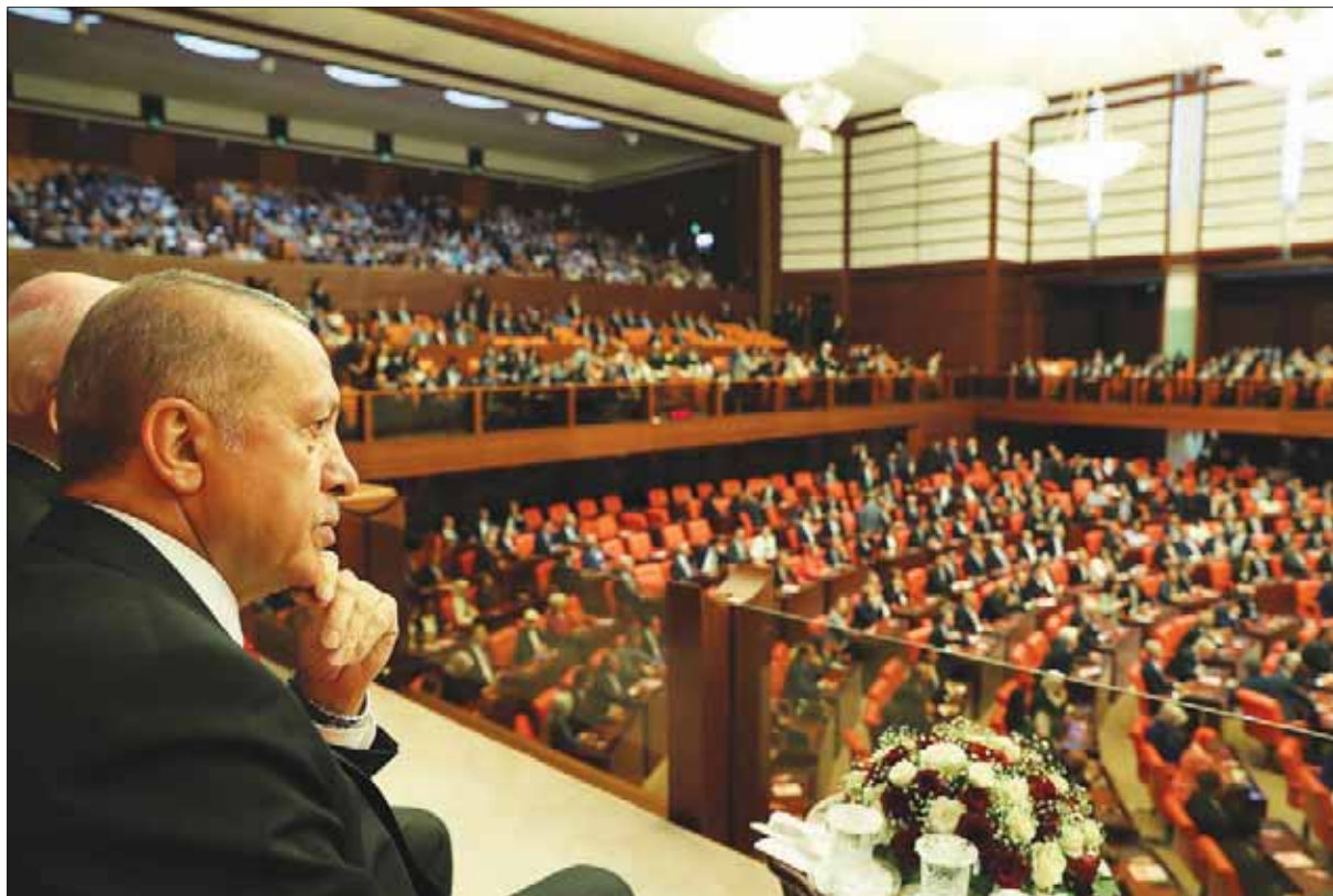
الرئيس التركي يحضر أول جلسة للبرلمان في أنقرة أول من أمس

وشملت المفوضية الأمم المتحدة لحقوق الإنسان 160 ألف شخص، منهم 50 ألف حوكموا في قضايا لها علاقة بالمحاولة الانقلابية، حركة غولن.