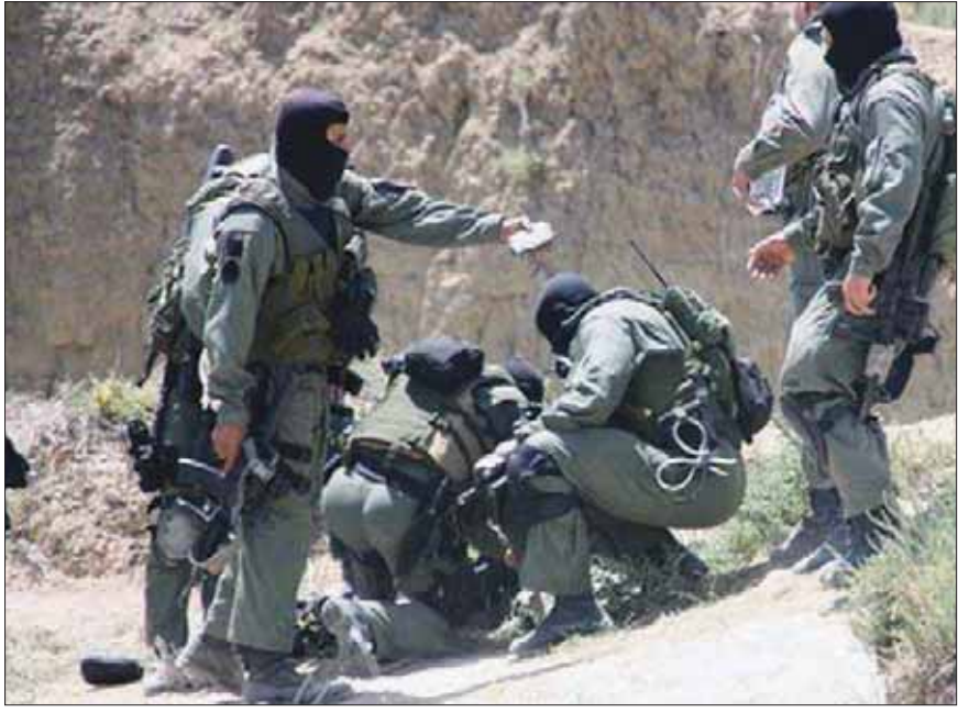
قوات مكافحة الإرهاب التونسية في إحدى عملياتها (الشرق الأوسط)

هذه المجموعات الإرهابية المحاصرة على مجموعة من العناصر المتعاطفة معها في إطار ما يسمى بـ«الخلايا الإرهابية النائمة»، البالغ عددها ما بين 300 و400 خلية إرهابية، وهي التي غالبا ما تدمرها بتحركات ومواقع قوات الأمن والجيش.