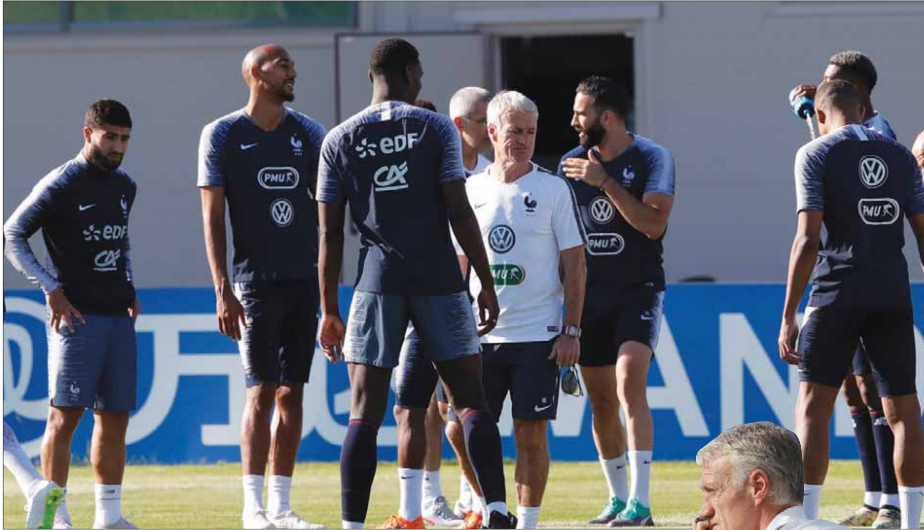
ديشامب يوجه لاعبيه في التدريبات قبل خوض معركة قبل النهائي

تماما وأطلق قذيفة مدوية برأسه في الزاوية المعقدة. ومع ذلك، يجب الإشارة إلى أنه لم يكن هناك أي ابتكار في هذه اللعبة، وأن الأمر لا يتجاوز كونه كرة نابتة تم تنفيذها بشكل جيد. ويجب الإشارة أيضا إلى الدور الذي لعبه تطبيق حكم الفيديو المساعد في هذا الأمر، لأن تطبيق هذه التقنية منع المدافعين من إعاقة المهاجمين، بالشكل الذي رأيناه مع فاران، حيث لم يتعرض لآلة إعاقة أو مسك من قبل مدافعي المنتخب الأوروغواياني. لقد أصبحنا نرى المدافعين وهم يتراجعون إلى الخلف دون التدخلات القوية التي كنا نراها في السابق، خوفا من أن تحتسب تقنية الفيديو المساعد ركلة جزاء ضدهم، لكن من المؤكد أن المدافعين سيصلون إلى حل وسط في مرحلة ما فيما يتعلق بهذا الأمر. وقد يتمثل الحل في أن يصب المدافعون كامل تركيزهم على لعب الكرة بالراس وليس التركيز على جسد المهاجم نفسه.