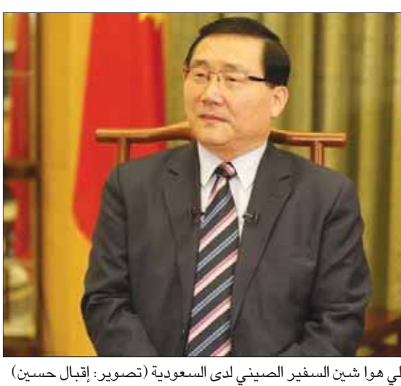
لي هوا شين السفير الصيني لدى السعودية

على أن بلاده سعت حديثاً لتفادي الدخول في أي خلافات أو مشكلات معيقة للمصالح المشتركة بواسطة المحادثات المباشرة أو الحوار وإلى اللجوء إلى القانون الدولي وإلى منظمة التجارة العالمية، معتبراً أن العقوبات الأحادية من بلد معين وفقاً لقانونه المحلي غير موضوعية، ولذلك فإن الصين ستعامل أميركا بالمقابل. جاء ذلك في وقت بدأت فيه في العاصمة الصينية بكين أمس أعمال منتدى التعاون العربي - الصيني، بهدف تعزيز ودعم العلاقات بين الجانبين في مختلف المجالات، ويتخلل المنتدى الاجتماع التشاوري