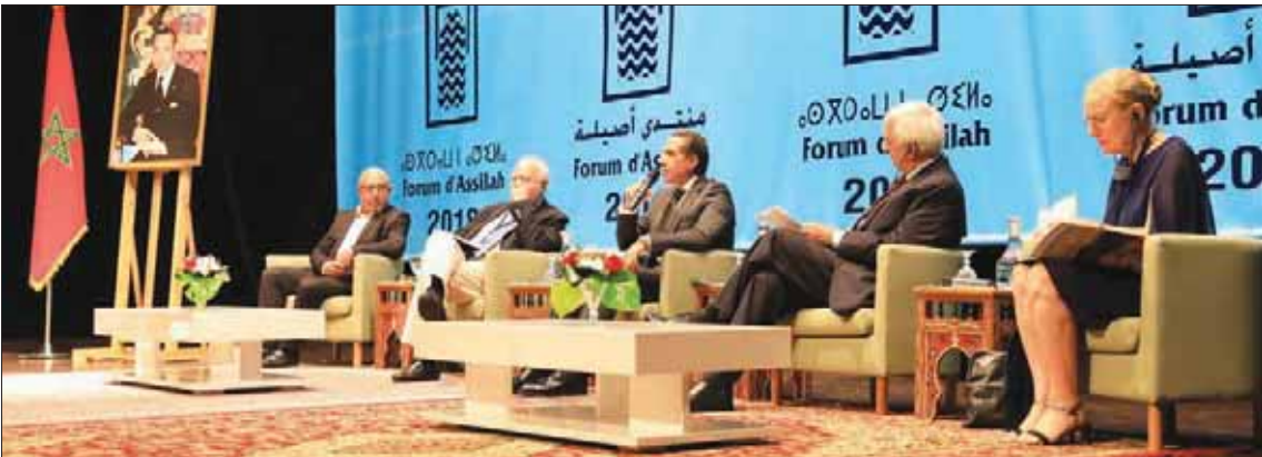
الجلسة الأولى من ندوة أصيلة الثالثة ويبدو مصطفى حجازي مستشار الرئيس المصري السابق (وسط) وميغيل أنخل موراتينوس وزير خارجية إسبانيا الأسبق ومحمد الأشعري وزير الثقافة والإعلام المغربي الأسبق وسلمان خورشيد وزير خارجية الهند الأسبق وبتينا فيريرو فالنتر وزيرة خارجية النمسا السابقة («الشرق الأوسط»)

طرححت إشكالية العولة في وقتنا جد مبكر، خلال دورة عام 1992. وأضاف أن المؤسسة ناقشت موضوع العولة قبل أن تتطور ملامحها وأنها توجد اليوم طرحها في صيغة «سؤال يوحي بإجابات واحتمالات عدة لا يستبعد منها «العالم والفتل». وأشار بن عيسى إلى أن تاريخه منذ الحرب العالمية الثانية، من حيث التطورات الاقتصادية والسياسية التي تعرفها جل الدول، مشيراً إلى أن العولة «صارت في رأي كثيرين مصدر تأثيرات سلبية على المنظومات القيمية والهويات الوطنية».