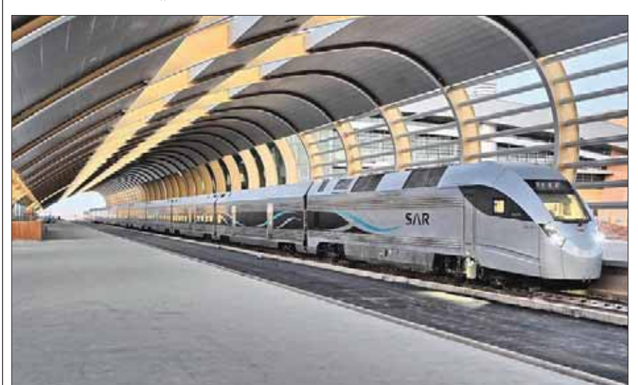
أضافت «سار» عدداً من الرحلات الجديدة ولا سيما في مواسم الأعياد