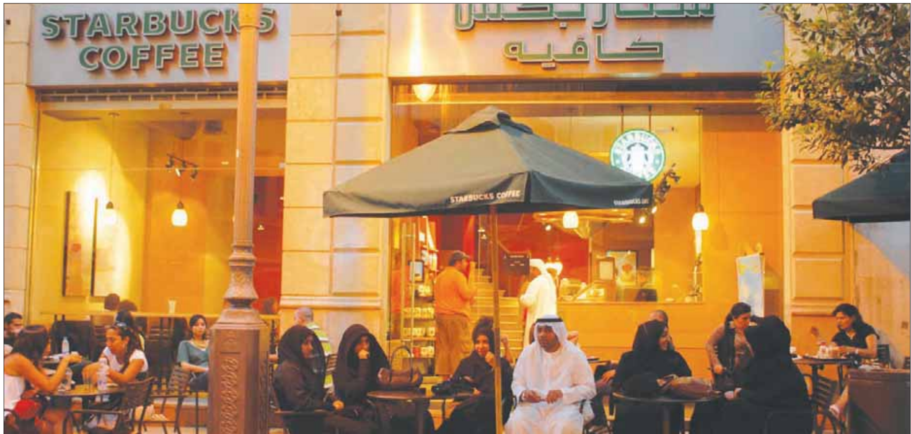
سياح خليجيين وسط بيروت عام 2008

من جهته، أمل النائب أنور خليل في كتلة التنمية والتحرير (حركة أمل)، «التوصل إلى تشكيل حكومة جديدة بأسرع وقت ممكن»، معتبراً أنه «على ما يبدو هناك حتى الآن بعض العقد التي لم تستوف عملية الحلحلة المطلوبة نظراً إلى عدم التفاهم من قبل بعض الجهات السياسية، ولأسف هناك تشنج لدى بعض الجهات السياسية بمواقف قد تكون غير ممتعة وهذا بشكل حاجزاً أمام لبنان بشكل عام لأنه من دون حكومة لا يمكن عمل شيء». وأكد خليل، في تصريح له عقب لقاء مع رئيس بلدية حاصبيا في الجنوب «أحقية رئيس الحزب التقدمي الاشتراكي، وليد جنبلاط،