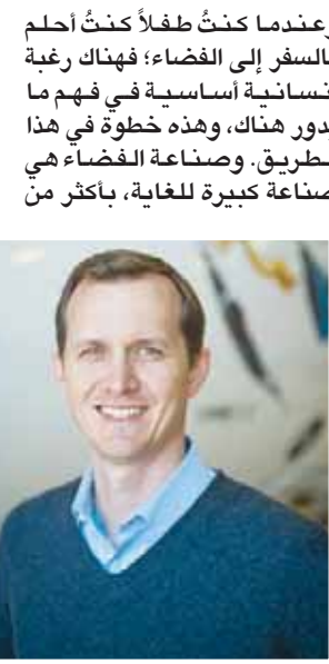
جورج وايتسايد الرئيس التنفيذي لشركة «فيرجن غالاكتيك»

«فيرجن» تستعد لإطلاق الرحلات التجارية للفضاء.