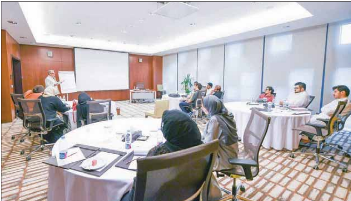
جانب من البرنامج التدريبي «صناعة الأفلام» بمشاركة 12 موهبة سعودية شابة من الجنسين

الموهب السعودية في هذا المجال وناهيها معرفياً، وذلك في سياق خطط الهيئة لإثراء المشهد الثقافي المحلي بالكوادر الوطنية المؤهلة في كافة التخصصات الإبداعية.