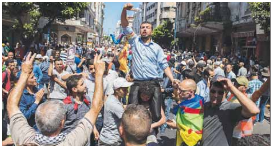
جانب من المظاهرة في الدار البيضاء، أمس