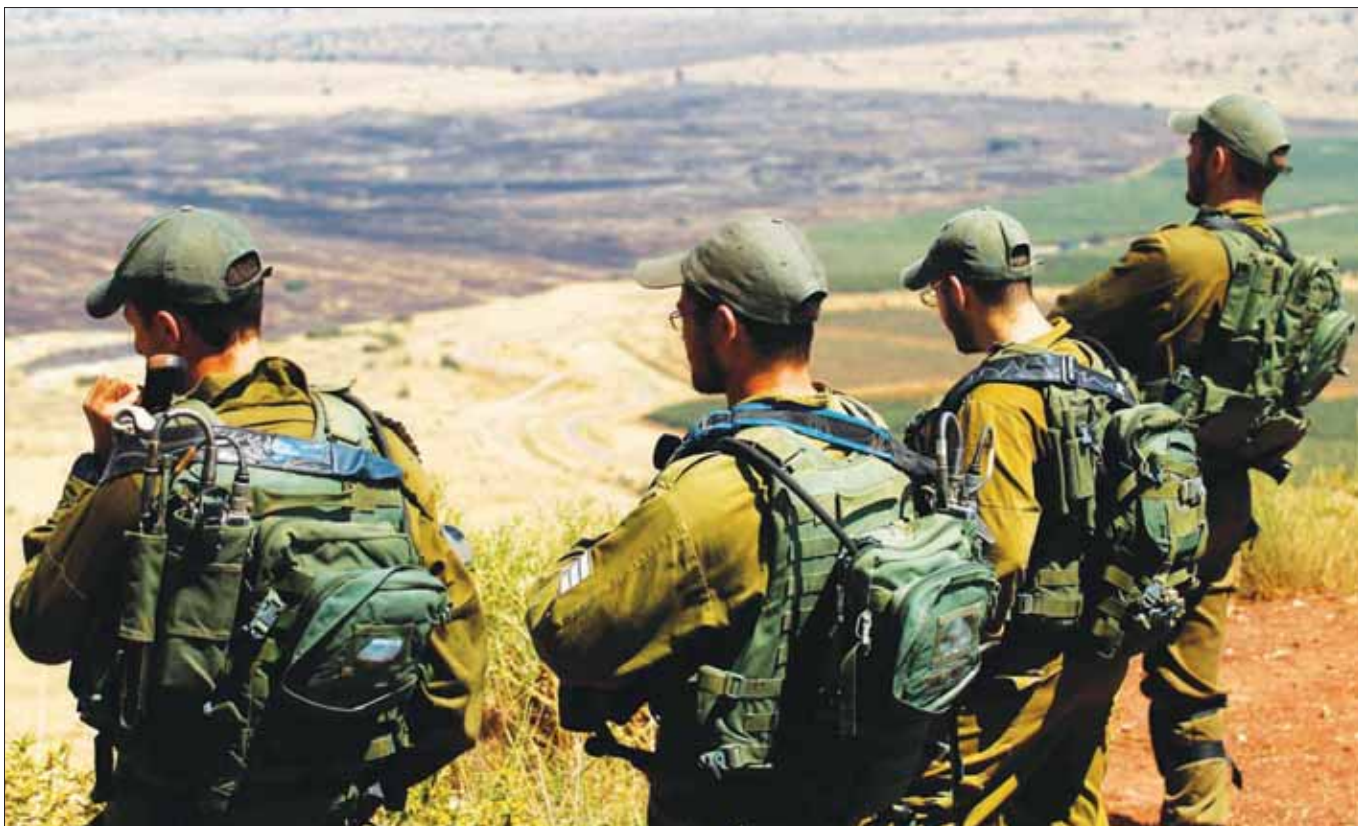
جنود إسرائيليون في هضبة الجولان المحتلة المواجهة للقنيطرة أول من أمس

أن نتينهاو «مهم جداً بقمة ترمب - بوتين»، لأنه «يأمل أن يتوصلا إلى صفقة القرن الحقيقية»، وهذه ليست الصفقة المموجة المتعلقة بحل القضية الفلسطينية. إنما هي الصفقة التي يأمل بها نتينهاو، وبموجبها ستقبل ترمب الاحتلال الروسي لشبه جزيرة القرم وشرق أوكرانيا، ويرفع العقوبات المفروضة على بوتين ويسمح له بالسيطرة على سوريا؛ وفي المقابل يهتم بوتين بطرد الإيرانيين واتباعهم من سوريا ويمنح نتينهاو انتصاراً تاريخياً». وأضاف: «في إسرائيل يعتمدون على بوتين، وأنا لست واثقاً من أنهم يعتمدون على الرجل الصحيح. من الجائز أن مطاقة إسرائيل الحقيقية في سوريا هو الأسد. الآن هو بحاجة إلى القاذفات الروسية والقوات البرية التي تاتمر من إيران، لكن عندما يسيطر على سوريا كلها، وعندما يعلن أنه المنتصر الأكبر في الحرب الأهلية، سيرغب في أن يكون الحاكم الوحيد. فقد قام الإيراني بدوره، وبإمكانه الانصراف: هكذا كان والده سينتصر. حافظ الأسد هو العدو الوحيد الذي تشتاق إسرائيل إليه».