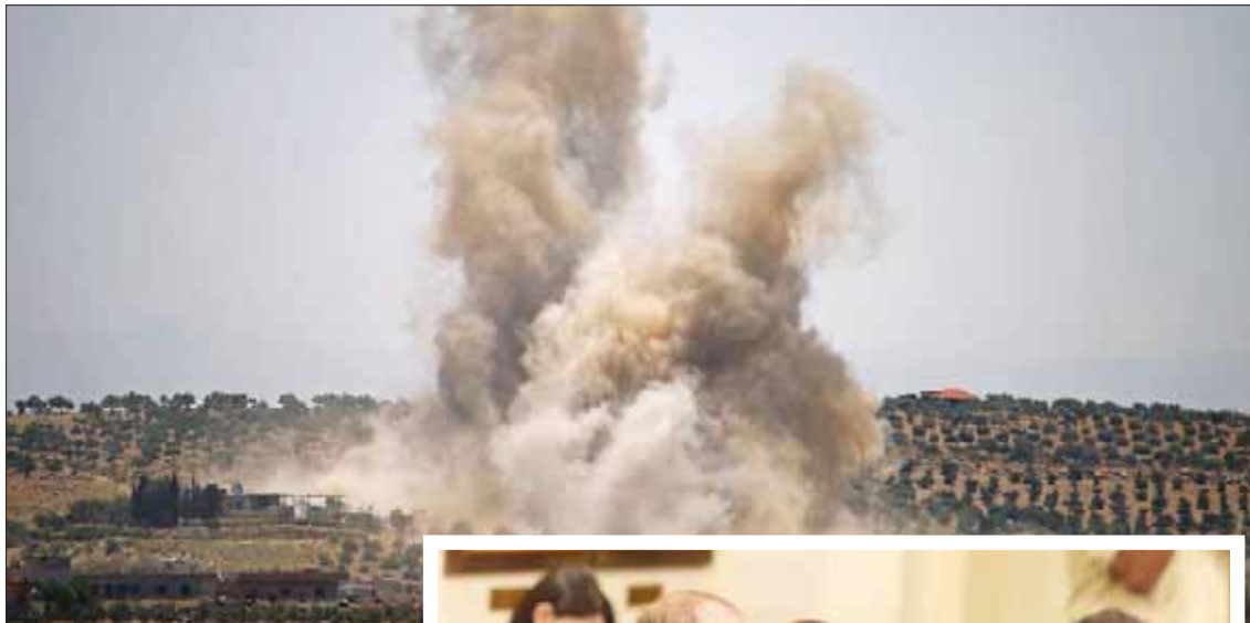
دخان فوق شرق درعا بعد ضربات جوية من طيران النظام أمس

وكان من المفترض أن تبدأ عملية إجلاء غير الراجين بالنسوية صباح أمس (الأحد)، بعد تجهيز مائة حافلة لنقل الدفعة الأولى، وفق المتحدث الذي أشار إلى أنها تاجلت إلى وقت لاحق «تقريباً يومين». ومن المقرر أن يتم تنفيذ الاتفاق في درعا على 3 مراحل بدءاً بريف المحافظة الشرقي