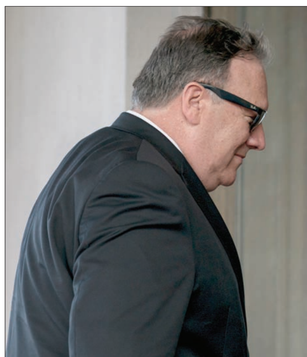
وزير الخارجية الأمريكي مايك بومبيو يتحدث في بيوتنغ يانغ الملف النووي ومسألة رفات الجنود المفقودين خلال الحرب الكورية

درجة عالية» لترسانة بيونغ يانغ النووية مثل عدد الرؤوس الحربية ومنشآت تخصيب اليورانيوم، خصوصا إذا لم تكن قيد التشغيل. من جانب آخر وجه زعيم كوريا الشمالية كيم رسالة إلى الرئيس الكوري السابق راؤول كاسترو، سلمها مسؤول كبير، الخميس، في هافانا، بحسب بيان رسمي مقتضب. وسلم الرسالة، التي لم يكشف مضمونها، نائب رئيس حزب العمل الكوري الشمالي ريسو سونغ لكاسترو، السكرتير الأول للحزب الشيوعي في كوريا، وفق مشاهدتها التلفزيونية في نشرته الإخبارية «خلال هذا اللقاء الودي، تجلت علاقات الود التقليدية والعلاقات المتنازعة بين الشعبين والحزبين والحكومتين». وترتبط كوريا الشمالية بعلاقات سياسية وثيقة، وفي هذا السياق تؤيد هافانا حلاً تفاوضياً للأزمة في شبه الجزيرة الكورية.