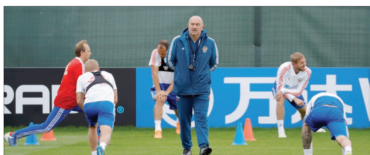
تشير تشيروف مدرب روسيا يراقب لاعبيه خلال الاستعداد للمواجهة الحاسمة مع كرواتيا

في تعويض الخطأ الكبير الذي ارتكبه في الدقيقة الأولى من مباراة المنتخب الكرواتي أمام نظيره الدنماركي في الدور الثاني للمونديال حيث تسبب في هدف التقدم للدنمارك وتصدى لثلاث من ركلات الترجيح التي احتكم إليها الفريقان بعد انتهاء الوقتين الأصلي والإضافي بالتعادل 1 - 1 معادلا بهذا الرقم القياسي لعدد التصديت الناجحة لركلات الترجيح في مباراة واحدة بكأس العالم. ويرتدي سوباسيتش اليوم قميصا داخليا يحمل صورة صديقه الراحل هرفوي كوستيتش الذي لقي حتفه في أحداث