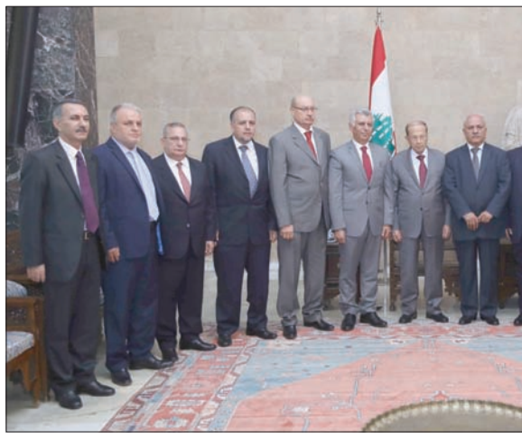
الرئيس ميشال عون لدى استقباله وفد العرقوب وشبعا