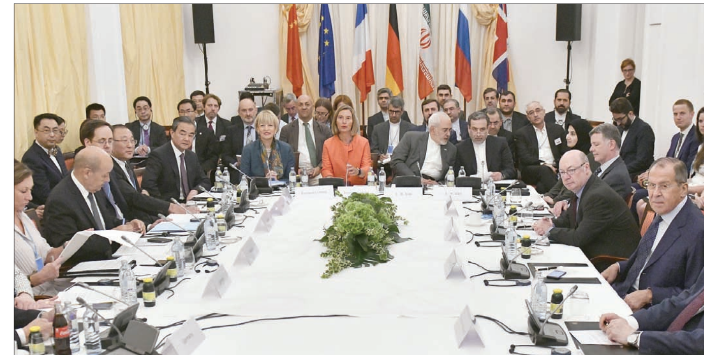
فيينا، «الشرق الأوسط» فيديريكا موغيريني تجلس بجوار وزير خارجية إيران جواد ظريف خلال اجتماع فيينا أمس (أ.ب.ب)

وزير الخارجية سيرغي لافروف قوله أمس في فيينا إن روسيا والصين ترغبان في إنقاذ الاتفاق النووي الإيراني. وتذكرت الوكالة أن لافروف أدلى بتصريحه خلال اجتماع مع وزير الخارجية الصيني وعضو مجلس الدولة وانغ يي في العاصمة النمساوية. ونقلت «رويترز» عن دبلوماسي أوروبي كبير: «أحرزنا بعض التقدم الذي يشمل حماية بعض مبيعات (النفط) الخام لكن من غير المرجح أن يلبي ذلك التوقعات الإيرانية. والأمر لا يتعلق فقط بما يمكن للأوروبيين فعله وإنما بكيفية إسهام الصينيين والروس والهنود وغيرهم أيضاً». وقال مسؤولون إيرانيون إن التأكيد من وجود إجراءات تضمن عدم توقف صادرات النفط إضافة إلى تمكن طهران من استخدام نظام سوفيت الدولي للتحويلات البنكية أو بديل له مسألة جوهرية بالنسبة لهم. وخلال زيارة لأوروبا هذا الأسبوع،