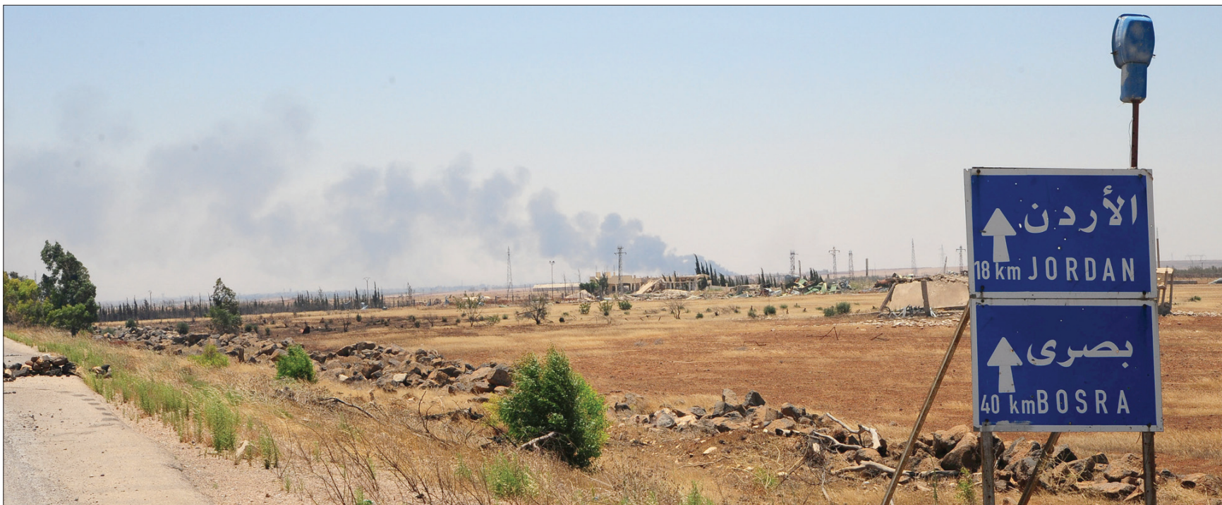
دخان يتصاعد من ريف درعا قرب حدود الأردن

مناطق خفض التصعيد في سوريا. وشهدت منذ يوليو الماضي وفقاً لإطلاق النار أعلنته موسكو مع واشنطن وعمان.