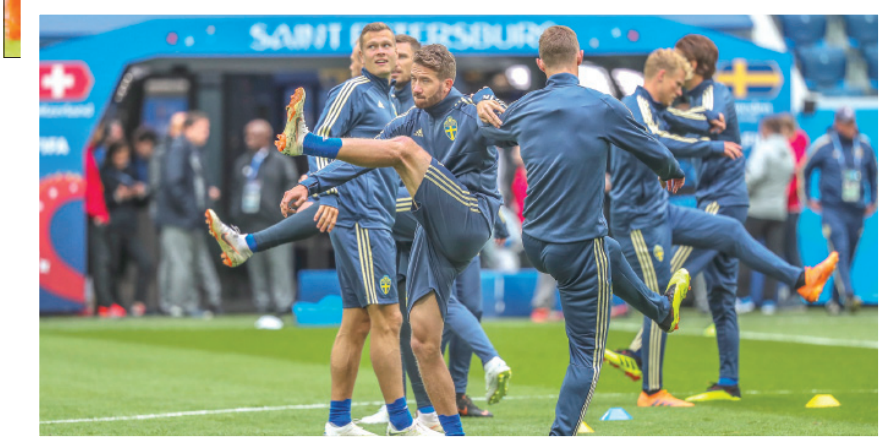
لاعبو السويد يتطلعون لمزيد من المفاجآت في المونديال الروسي (أ.ب.أ)

وقال إبراهيموفيتش من مقر ناديه لوس أنجلوس غلاكسي التدريري: «جائزة النجاح تزيد في أدوار خروج المهزوم. الأمر لا يتعلق بمدى جودة الفريق. الآن هناك الكثير من العواطف لأنه دور الثمانية. الفريق الذي يستطيع التعامل مع الضغط بشكل أفضل سيكون له أفضل. نعم، اعتقد أن منتخب السويد يوسع الفوز بكأس العالم مثلما قلت قبل بدء البطولة. تغلب على المكسيك وسويسرا. أيضا حقق نجاحا لم يتوقعه أحد». وأحرز إبراهيموفيتش 62 هدفا في 116 مباراة دولية مع السويد وثار جدل حول ما إذا كان على المدرب يان أندرسون إعادته للتشكيلة قبل نهائيات روسيا، لكن الأخير أشار إلى أن الفريق يؤدي بشكل أفضل بدون.