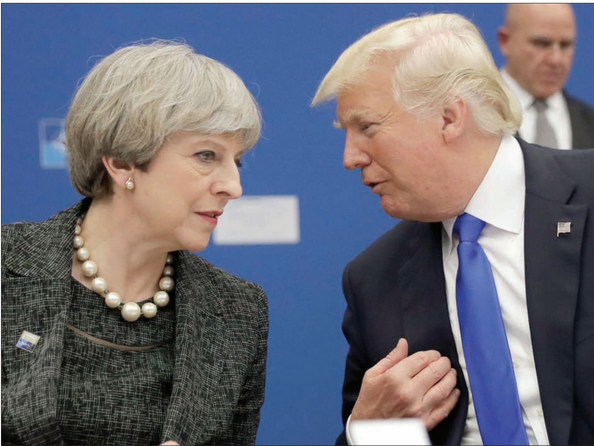
الرئيس ترمب مع رئيسة وزراء بريطانيا تيريزا ماي خلال اجتماع «الناتو» الأخير في بروكسل. وسيبدا الرئيس الأمريكي زيارة لبريطانيا الأسبوع المقبل... وسيتم استقباله على عشاء مع رجال الأعمال في قصر ريفي بعيدا عن لندن

أن العقوبات كلفت روسيا حتى الآن مئات المليارات، إلا أن النمو الأوروبي تآثر أيضا بهذه العقوبات حيث تعيق هذه الإجراءات العقابية أيضا التجارة التي كانت تقوم بها العديد من الشركات الأوروبية مع روسيا، حيث حظرت الحكومة الروسية استيراد سلع غربية كالمنتجات الزراعية مثل الفاكهة واللحوم. ومن جانب آخر، أشار استطلاع للرأي، تم إجراؤه بتكليف من الحملة الدولية للقضاء على الأسلحة النووية للولايات المتحدة في دول الناتو يريدون من الولايات المتحدة أن تزيل أسلحتها النووية، المتمركزة بها. وأظهر الاستطلاع، الذي تم إجراؤه في بلجيكا وألمانيا وهولندا وإيطاليا، رغبة أغلبية واضحة في جميع الدول الأربع، أن تزيل الولايات المتحدة الأسلحة النووية، طمحا لما ذكرته أمس الجمعة في جنيف الحملة الدولية التي فازت بجائزة نوبل للسلام العام الماضي. وتراوحت نسبة الموافقة بين 56 في المائة في بلجيكا إلى 70 في المائة في ألمانيا. وذكرت أغلبية من المواطنين أنهم يريدون من حكوماتهم الانضمام إلى معاهدة حظر الأسلحة النووية الأممية الجديدة، التي وقعت عليها 59 دولة منذ سبتمبر (أيلول). ولم توقع على المعاهدة أي دولة من أعضاء الناتو، من بينها الدول الأوروبية، التي تعتمد على الرؤوس الحربية الأمريكية للأمن. يأتي الاستطلاع قبل عقد قمة الناتو في بلجيكا. وجرى الاستطلاع في الفترة من 18 حتى 21 يونيو (حزيران)، من قبل شركة «يوغوف» البريطانية لاستطلاعات الرأي، بين حوالي ألف شخص، في كل من بلجيكا وإيطاليا وهولندا وحوالي ألفين في ألمانيا.