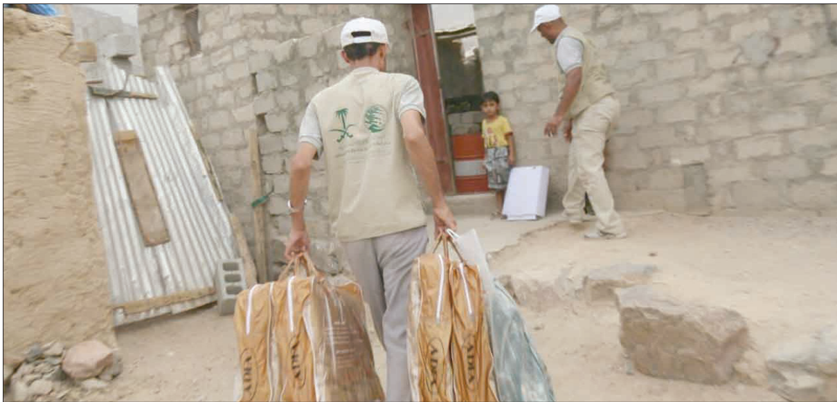
جانب من المساعدات السعودية التي وصلت مديرية نعلان بمحافظة البيضاء أمس (واس)

للإغاثة أمس بتوزيع مساعدات إيوائية في مديرية نعلان في محافظة البيضاء التي تتميز بتضاريسها الجبلية الصخرية الصعبة إلى الأسر المحتاجة في المديرية يستفيد منها 6048 فرداً، كما وزع المركز أول من أمس 2016 كرتوناً من التمور من 6048 مستفيداً، تقبل جزءاً من إجمالي المخصص للمحافظة البالغ 3000 طن. إلى ذلك واصل مركز الملك سلمان للإغاثة توزيع المساعدات الغذائية للنازحين