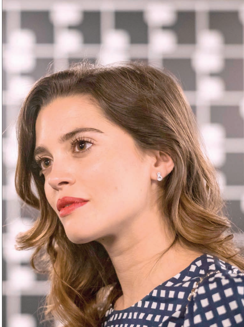
المثلة البرتغالية جوانا ريبيرو حضرت عرض فيلم «الرجل الذي قتل دون كيشوت» في مهرجان كارلوفي فاري للسينما الدولية في مدينة كارلوفي فاري في جمهورية التشيك

وبالمناسبة فإني أعذ عن هذه الفقرة التي أوردتها، ولكن هذه هي الحياة، يفقد ما فيها كثير مما يبهج، ففيها أيضاً كثير مما (يغص).