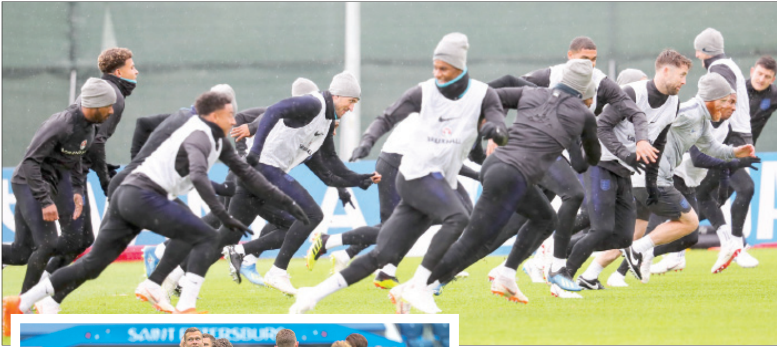
لاعبو المنتخب الإنجليزي خاصوا التدريبات بحماس أمس قبل مواجهة السويد الحاسمة