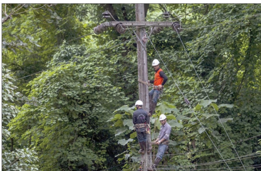
عمال الإنقاذ يعملون على التوصيلات الكهربائية بالقرب من الكهف

قال أحد الغواصين الذين قابلوا الصبية المحتجزين إنهم كانوا يسألونه عن نتائج المباريات، ومن جانبهم سجل لاعبو منتخبات إنجلترا والسويد رسائل فيديو للصبية قائمين لهم السلامة، كما أعلن «فيفا» أنه سيدعو الصبية بعد كأس العالم. وكانت المجموعة قد زارت كهف تام لونغ - كون نام نانج نون (الف كيلومتر شمال بانكوك بالقرب من الحدود التايلاندية مع ميانمار) في 23 يونيو (حزيران)، وسد فيضان طريق خروجهم.