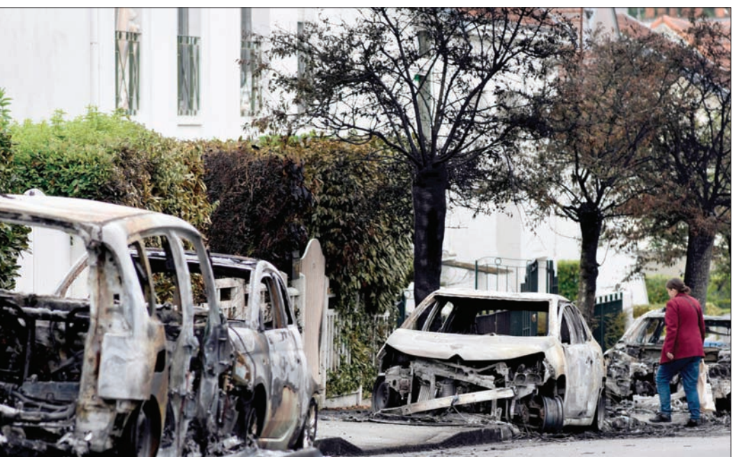
سيارات محروقة بعد ليلة من الشغب في شوارع مدينة نانت في غرب فرنسا

من وحشية الشرطة. لكن قوات الأمن كثيرا ما تعتبر هدفاً. وفي حادثة منفصلة، تعرض زوجان شرطيان خارج الدوام، ليل الأربعاء لهجوم على مرأى من طفلتهم البالغة من العمر ثلاث سنوات في أحد الأحياء شمال شرقي باريس، بعد وقت قصير على مغادرتهم حفل عشاء. وقال مصدر في الشرطة إن المهاجمين تعرفوا على الشرطة لأنها استوفقتهم مؤخراً لطلب بطاقة الهوية، في منطقة أولني - سو - بوا، التي تسجل نسبة عالية من الجرائم. واستنكر الرئيس إيمانويل ماكرون الهجوم بوصفه «عملاً مروعا وجباناً»، وتعهد «بالعفور على المشتبه بهما ومعاقبتهما». وتم اعتقال أحدهما فيما الثاني لا يزال فارا. في 2005 اندلعت أعمال عنف في أنحاء البلاد في أعقاب وفاة شابين من أصول أفريقية ضعفاً بالكهرباء أثناء احتفالهما من الشرطة في حي كليشي - سو - بوا الباريسي. كما تصاعد الغضب إزاء العنف الذي مارسته الشرطة العام الماضي، بعد تعرض شاب أسود في حي