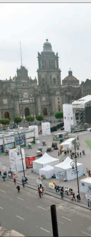
ميدان زوكالو في مكسيكو سيتي أثناء الانتخابات التي جرت أخيراً

في عهد تشيفيريا يتولى وزارة الداخلية، عندما أمر بقمع الاحتجاجات الطلابية في العاصمة مكسيكو خلال دورة الألعاب الأولمبية، مما أدى إلى وقوع عشرات القتلى، وأثار احتجاجات واسعة في الداخل والخارج. لكن ذلك لم يمنع انتخابه رئيساً للجمهورية عام 1970، ليعدو.