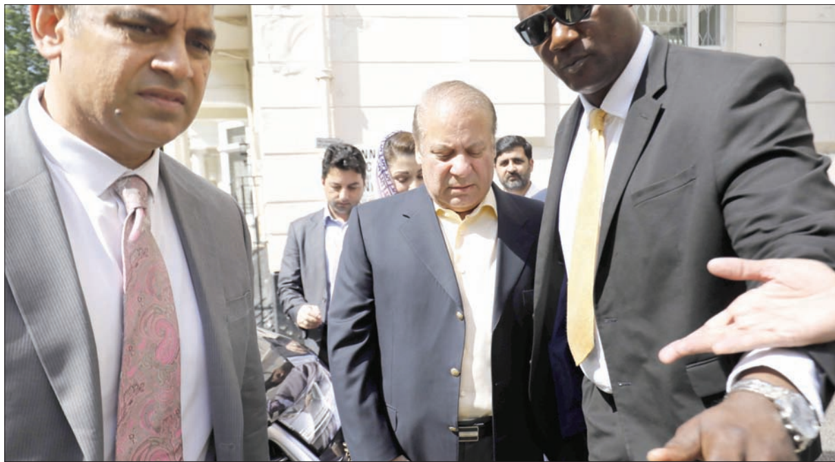
نواز شريف رئيس وزراء باكستان السابق في لندن بعد صدور الحكم من قبل محكمة الفساد في باكستان أمس

واجه شريف الكثير من التحديات في الماضي إلا أنه تمكن من تجاوزها. ففي عام 1993 أقيل من منصبه رئيساً للوزراء أثناء ولايته الأولى بينهم فساد وفي 1999 تم الحكم عليه بالسجن المؤبد بعد ولايته الثانية التي انتهت بانقلاب عسكري. وعقب الانقلاب سمح له بالتوجه للعيش في المنفى وعاد منها في 2007 ليصبح رئيساً للوزراء لولاية ثالثة في 2013