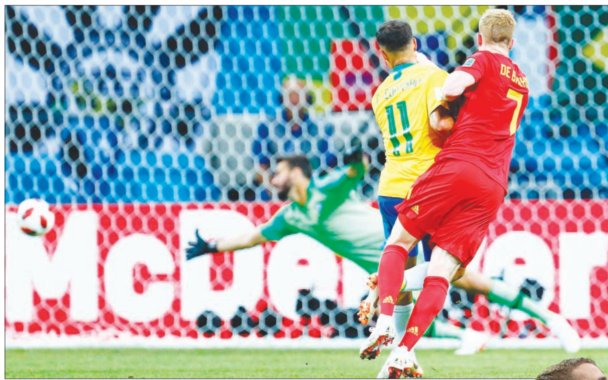
دي برون نجم بلجيكا (رقم 7) يسدد صاروخاً ليسكن مرمى البرازيل

وفي الدقيقة 35، اخترق سريعاً عبر الجهة اليمنى وحول الكرة لدخل المنطقة، تجاوزت موسليرا دون أن تجد أي لاعب لتتابعها. وقبل خمس دقائق على نهاية