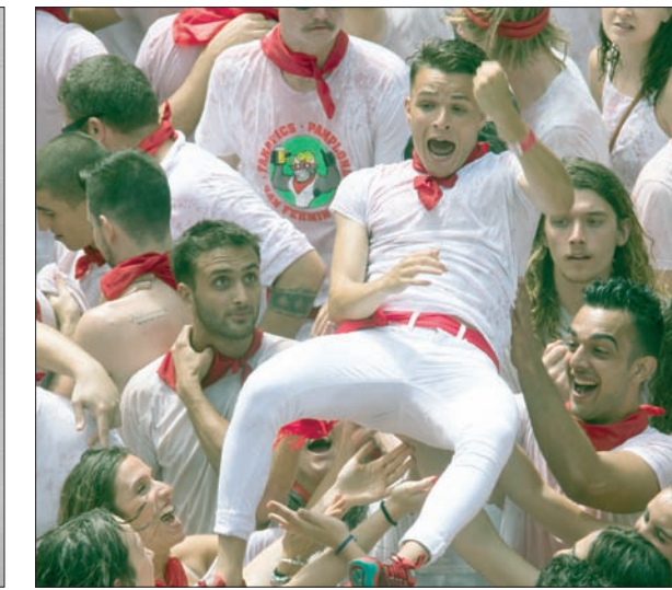
أكثر من مليون زائر يتوافدون في مثل هذه الأيام من أنحاء العالم إلى المدينة