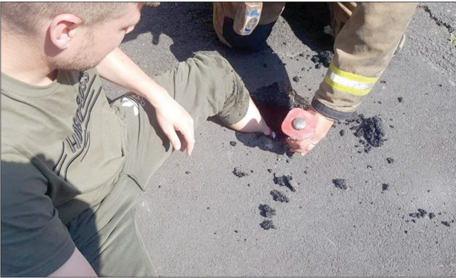
رجال الإطفاء أثناء تخليص قدم الرجل من الإسفلت

اضطر رجال الإطفاء إلى إنقاذ رجل بعد أن غرست قدمه في الإسفلت اللين، بسبب درجات الحرارة المرتفعة في مدينة نيوكاسل الإنجليزية. واتصل بالرجال البالغ من العمر 24 عاماً بخدمات الطوارئ بعدما غرست قدمه اليسرى في الإسفلت، بشوارع خلفي بمنطقة هيتون في نيوكاسل، وهو في طريقه لشراء وجبة الإفطار، بحيث أصبح غير قادر على التحرك، واستخدم رجال الإطفاء المطارق لتحطيم الإسفلت حول قدمه، حتى تمكنوا من إخراجها من دون أي إصابات، وذكروا أن عدم إصابته ترجع لأنه كان يرتدي حذاءً من طراز «دكتور مارتين» الضخم.