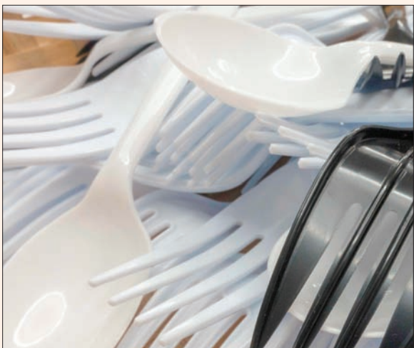
برلين: «الشرق الأوسط»

الحصول على كوب من القهوة في الطريق أثناء التوجه للعمل، شراء طبق من السلطة الطازجة في الغداء، وعند العشاء، تناول إحدى الوجبات السريعة في متجر فينتامبي محلي. يبدو ذلك كيوم عادي لشخص ما يعيش في مدينة كبيرة، ولكن ذلك يترك أثره على البيئة. في حقيقة الأمر، كل يوم، كل شخص ينتج نحو دلو من المخلفات البلاستيكية.