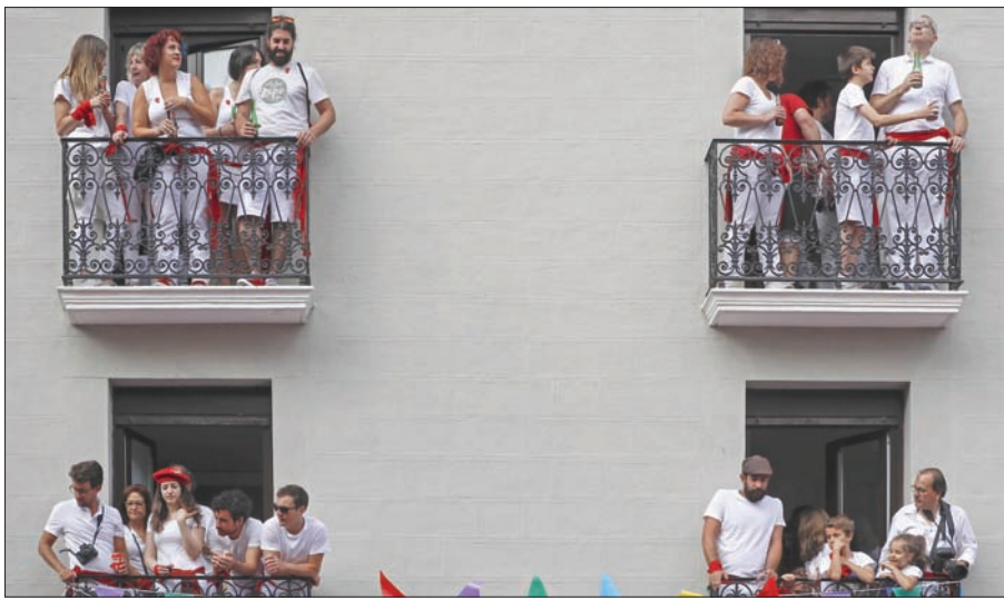
أصحاب المنازل المطلّة على الاحتفالات يؤجرون شرفاتهم بـ 150 دولاراً يومياً للشخص الواحد