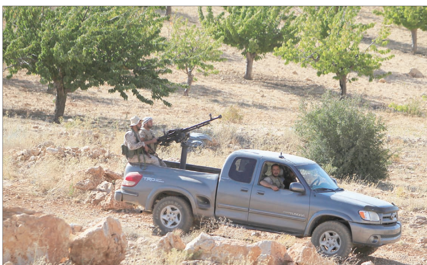
صورة من الأرشيف لعناصر من «حزب الله» خلال معارك جرد عرسال (رويترز)