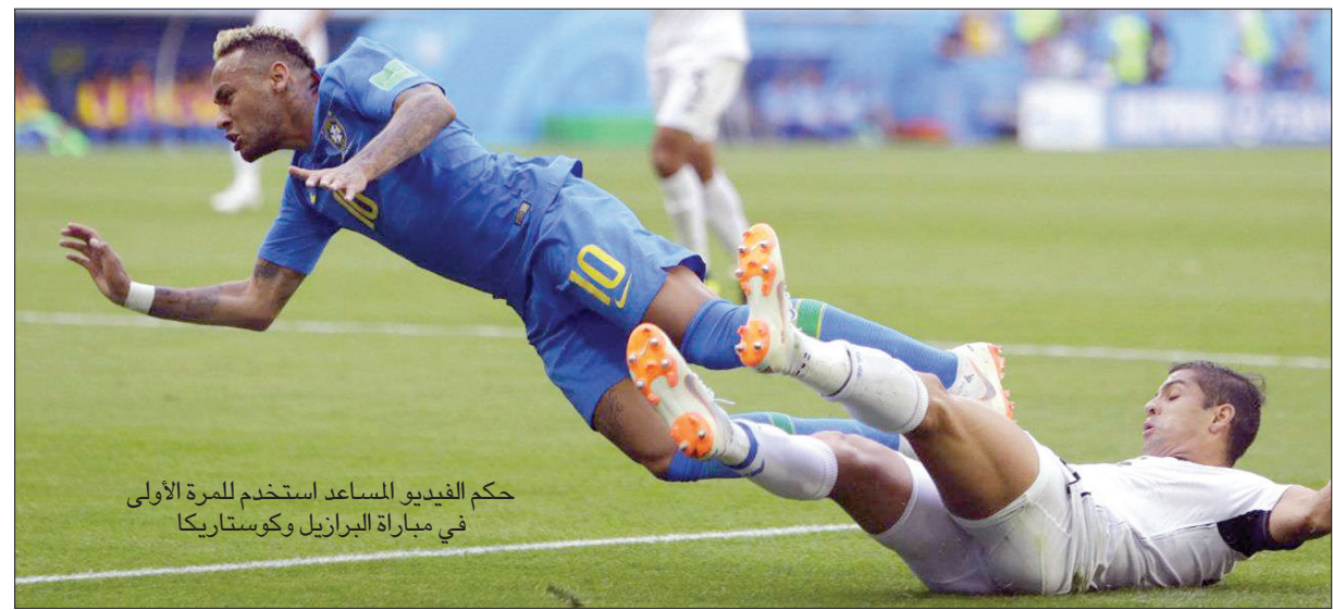
حكم الفيديو المساعد استخدم للمرة الأولى في مباراة البرازيل وكوستاريكا

خرج جني التكنولوجيا من القمم، وبينما لا يزال النظام في حاجة إلى مزيد من التحميص حتى يصل إلى ذروة كفاءته، فإنه يظهر بالفعل علامات على أنه قد يؤدي إلى تغيير جذري. ووسط كل هذه المناقشات والإثارة، أظهر واحد من البارزين في الجانب المظلم من كرة القدم رغبة في التنازل. وأصبح لويس سواريز، الذي لعب دور الشرير في كأس العالم 2014، شخصاً مختلفاً تحت تدقيق الكاميرات، وبقي بعيداً عن المشاغل. وقال مهاجم أوروغواي السابق بسبب انتقاداته الحكام «في مباراة صعبة وحمامية» واعتذر مارادونا سريعاً. وأشار مشهد جايجر وهو محاط من جميع الجهات بلاعبين كولومبيا