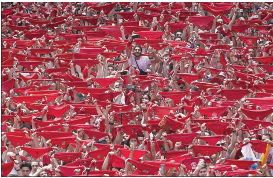
المتداول الحمراء سيدة المشهد