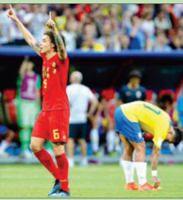
فرحة بلجيكية وانكسار برازيلي