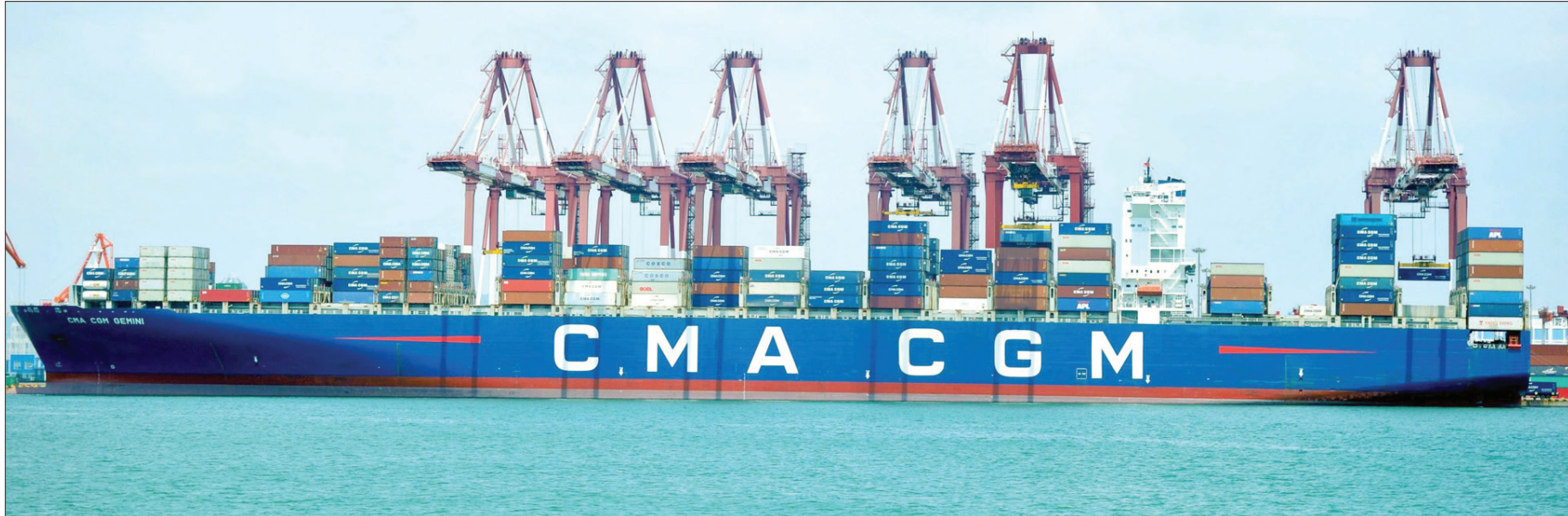
واشنطن، عاطف عبد الطيف

دخلت الحرب التجارية بين الولايات المتحدة والصين يومها الأول أمس، بعد أن أطلقت الولايات المتحدة رصاصتها الأولى في وجه الصادرات الصينية وبدأت فعلياً في تطبيق المرحلة الأولى من حزمة الرسوم الجمركية التي أعلنت عنها قبل أسابيع. فمنذ الثانية عشرة منتصف الليل مساء أمس الجمعة (بالتوقيت الشرقي) بدأت الموانئ وسلطات الجمارك الأمريكية في تحصيل رسوم جمركية بنسبة 25 في المائة على صادرات صينية بقيمة 34 مليار دولار، وعلى الفور أطلقت الصين رصاصة مضادة في وجه الصادرات الأمريكية حيث فرضت رسوماً جمركية بنسبة 25 في المائة على صادرات أميركية بنفس القيمة التي استهدفتها الرسوم الأمريكية وهي 34 مليار دولار.