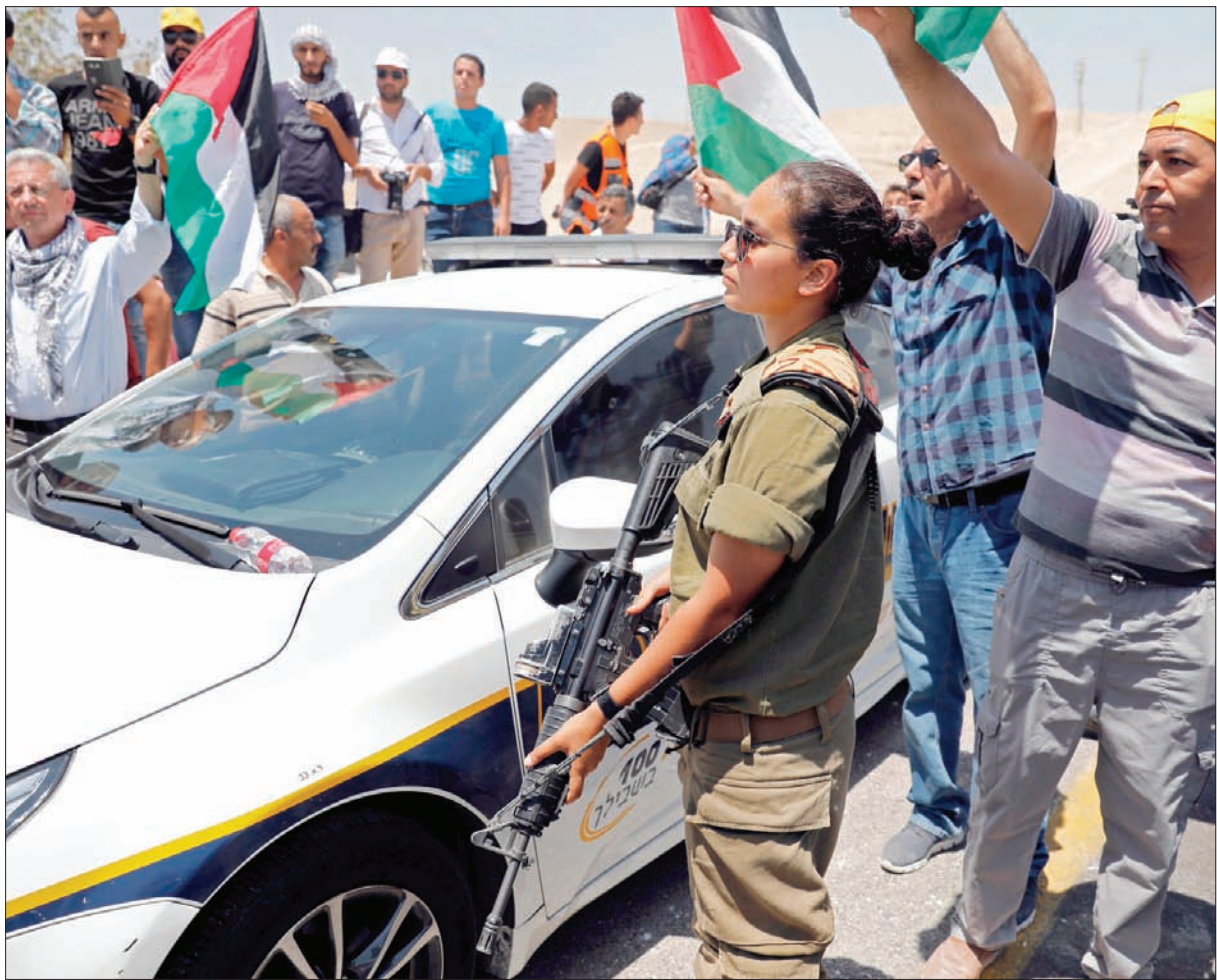
مجندة اسرائيلية تقف قرب فلسطينيين يحتفلون بقرار تجميد هدم الخان الأحمر

وانضم إلى هذا الموقف أمس الجمعة، جيمي ماكغولدريك، المنسوق الإنساني، واشكوت أندرسون، مدير العمليات في وكالة الأمم المتحدة لإغاثة وتشغيل اللاجئين الفلسطينيين (الأونروا) في الضفة الغربية، وجيمس هينان، رئيس مكتب مفوض الأمم المتحدة السامي لحقوق الإنسان، الذين عبروا عن قلقهم البالغ إزاء عمليات الهدم والأحداث المرتبطة بها في التجمعات السكانية الفلسطينية الضعيفة في وسط الضفة الغربية.