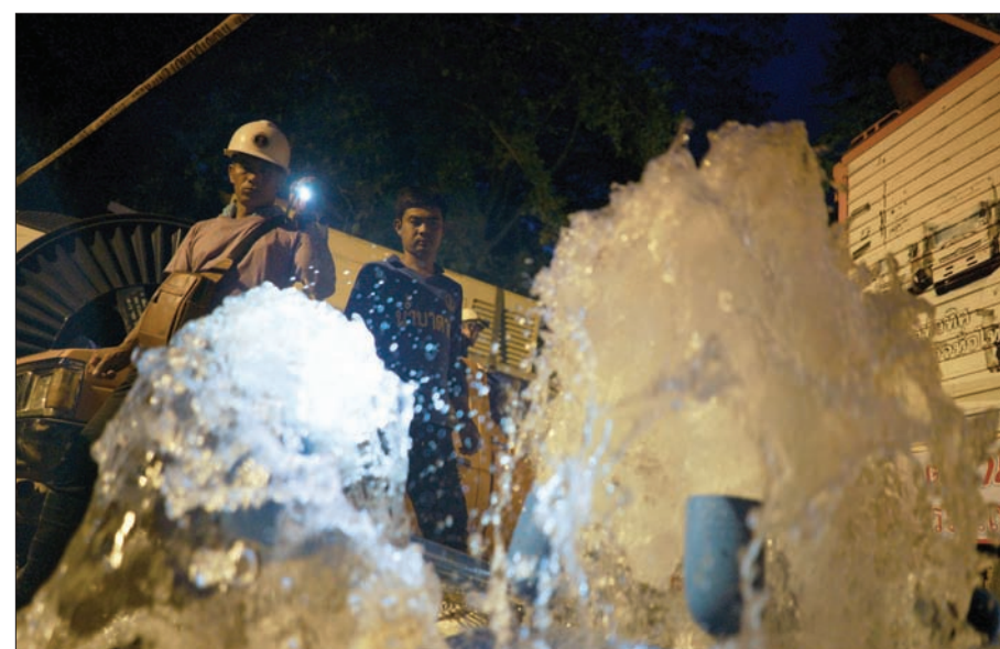
عملية سحب الماء من الكهف مستمرة بأمل تقليل منسوب الماء داخل الكهف

لو كنت ترتدي ملابس الغطس». جدير بالذكر أن نقص الأكسجين داخل الكهف يُعتبر خطراً على رجال الإنقاذ وفريق كرة القدم الذي تتراوح أعمارهم بين 11 و16 عاماً، ومدربهم البالغ من العمر 25 عاماً. ويعمل العمال على وضع أنبوب يبلغ طوله 4,7 كيلومتر لتوصيل الأكسجين إلى الأماكن الأعماق بالكهف ترتبط مع خط هاتفي ليتمكن الصبية المحتجزين في الداخل من التواصل مع ذويهم. ويتوقع البعض أن تبدأ