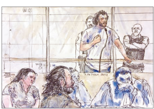
رسم تشبيهي لـ «داعش» في محكمة فرنسية في يونيو الماضي

ولا تتعقب آخرين». وخلال الشهور القليلة الماضية، وفي سلسلة تصريحات جنرالات أميركيين، قالوا إن الحرب ضد تنظيم داعش ليست قصيرة، وليست سهلة. إلى ذلك، قال قائد قوات المارينز، الجنرال روبرت نيلر، إن هذه الحرب «يجب أن تتضمن مشاركة مباشرة في القتال في سوريا والعراق، ومساعدة دول أخرى في ذلك». كما