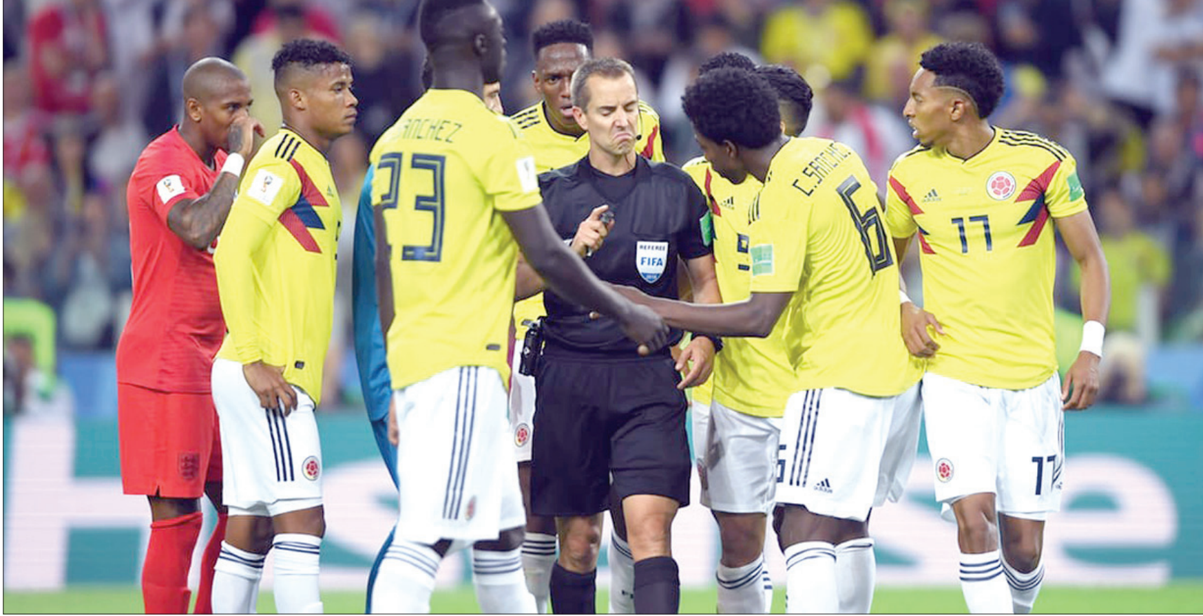
لاعبو كولومبيا يحتجون على احتساب ركلة جزاء في المواجهة أمام إنجلترا

ومن الإنصاف أن نقول إن كرة القدم قد انحدرت إلى لعبة يغيب فيها القانون في بعض الأحيان.