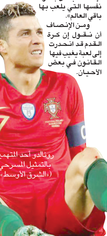
رونالدو أحد المتهمين بالتمثيل المسرحي

لكن الصعوبة تكمن بالطبع في معرفة الأسباب الحقيقية لسقوط اللاعب - سواء أثناء المباراة أو حتى عند إعادة مشاهد السقوط أكثر من مرة في اليوم التالي - لأن هناك بعض الحالات التي يكون فيها اللاعب هو الشخص الوحيد الذي يعرف ما إذا كان يتظاهر بالسقوط لخداع الحكام أم لا. وعلى أي حال، يجب اتخاذ إجراءات فورية لمواجهة هذه الظاهرة. ويتعين على الاتحاد الدولي لكرة القدم، على أقل تقدير، أن يظهر أنه عازم على مواجهة هذه المرص، ويجب على الحكام أن يكونوا أكثر حزمًا، كما يتعين على اللاعبين أيضاً أن يتحملوا القليل من المسؤولية عن أفعالهم.