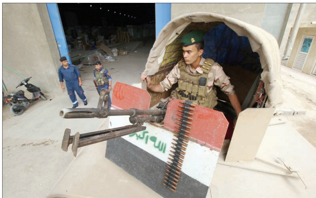
عناصر من الجيش العراقي والشرطة عند مدخل احد المصانع الحيوية في البصرة

ويبتعد الصمدي الطريقة التي تسلكها الأجهزة الأمنية العراقية في حماية المناطق التي تتعرض إلى هجمات «داعش» مبيناً أن «الحل يكمن في تسليح جزئي لأبناء تلك المناطق وذلك من خلال توفير سلاح خفيف ومتوسط لكل قرية من القرى التي تتعرض للتهديد لكي يتمكن الأهالي من صد غارات التنظيم بالإضافة إلى تسليح شبوخ العشائر مع توفير مرابطات صغيرة بالاتفاق مع الأهالي من أجل ضمان أمن تلك المناطق».