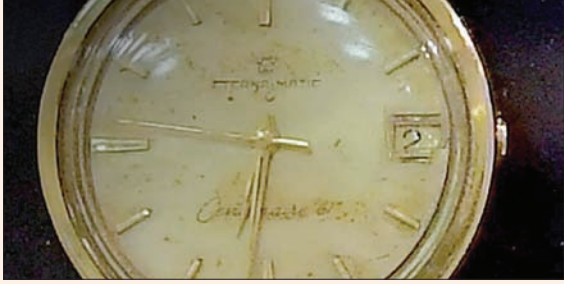
صورة وزعتها إسرائيل للساعة المنسوبة إلى إيلي كوهين

تل أبيب، الشرق الأوسط في عملية اعتبرها رئيس الوزراء بنيامين نتانياهو «عملاً شجاعاً بطولياً»، استردت إسرائيل ساعة اليد الخاصة التي كان يرتديها الجاسوس الإسرائيلي الشهير إيلي كوهين، الذي أعدم في دمشق عام 1965. وهنا نتخباها «مقاتلي الموساد على عملهم الحازم والشجاع الذي أعاد إلى إسرائيل وتذكراً من مقاتل عظيم قدم الكثير لتعزيز أمن دولة إسرائيل»، لكن تبين أن الحصول على الساعة تم بشرائها في مزاد علني عادي. وكان جهاز المخابرات الإسرائيلية الخارجية (الموساد)، قد أعلن مساء أول من أمس، أنه أعاد في عملية خاصة، نفذها أخيراً، ساعة اليد التي ارتداها الجاسوس الإسرائيلي إيلي كوهين قبل إعدامه. وقال رئيس الموساد السابق، يوسي كوهين، الذي تم اقتناء الساعة في عهده: «لن ننسى إيلي كوهين أبداً. تراثه الذي يتميز بالإخلاص والحزم والشجاعة وبحب الوطن مع تراثنا. نحن على اتصال دائم وحميم مع زوجته وعائلته. إيلي ارتدى ساعة اليد هذه في سوريا حتى اليوم الذي تم فيه إلقاء القبض عليه وكانت الساعة جزءاً من هويته العربية المزيفة». وأصدر نتانياهو بياناً خاصاً أشاد فيه بعملية استرداد الساعة، كما لو أنها كانت عملية عسكرية بطولية نفذها «مقاتلو الموساد بحزم وشجاعة». ولكن تبين أن استعادة ساعة اليد لم تكن سوى عملية شراء عادية في مزاد أحد مواقع التسوق على الإنترنت. وقالت أرملة كوهين