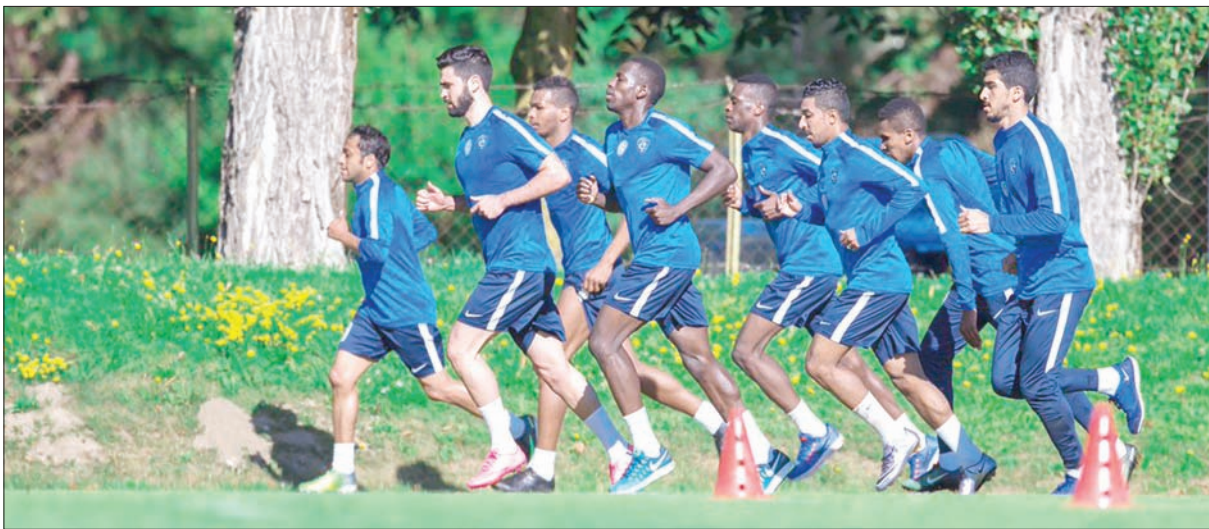
الهلال اختار النمسا مجدداً لإقامة معسكره التدريبي

من الشهر الحالي موعداً لانطلاق المعسكر الإعدادي في سلوفينيا، ويستمر حتى 9 أغسطس، وسيخوض الفريق الشباني عدداً من المباريات التجريبية مع الأندية السلوفينية المحلية قبل العودة مجدداً إلى الأراضي السعودية، والتوجه إلى مدينة توبوك للمشاركة في بطولة توبوك الدولية. وحددت إدارة الاتفاق مدينة تيل في هولندا للانخراط في المعسكر الخارجي، الذي ينطلق في 3 من يوليو (تموز) الحالي ويستمر حتى 31 من الشهر نفسه، وستتخلله إقامة عدد من المباريات التجريبية، قبل العودة إلى الدمام لبدء المرحلة الثالثة التي ستستمر حتى موعد انطلاق النمسا، لإقامة معسكره الخارجي هناك، والذي سينطلق في 21 يوليو الجاري، حتى 13 أغسطس، على أن يخوض الفريق القدساوي خمس مباريات تجريبية. وستتوجه بعثة نادي التعاون إلى هولندا لإقامة معسكر يستمر 18 يوماً، والذي ينطلق في 6 من يوليو حتى 24 من الشهر نفسه، على أن يخوض الفريق خمس مباريات تجريبية تم تحديدها مسبقاً، قبل العودة إلى القصيم واستكمال مرحلة الإعداد بمعسكر داخلي، وحددت إدارة نادي الرائد موعد المعسكر الخارجي لكنها لم تختار