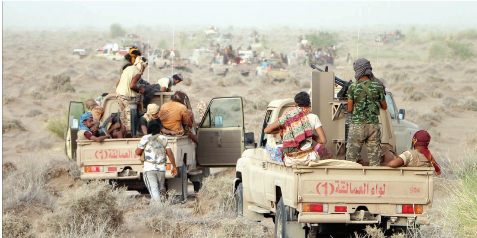
جانب من تقدم قوات المقاومة اليمنية المشتركة في الساحل الغربي