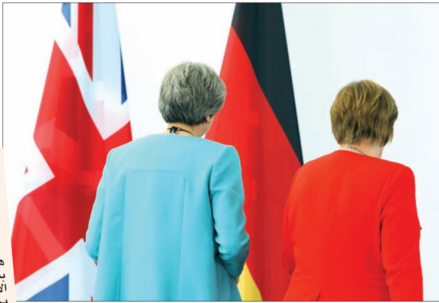
المستشارة الألمانية أنجيلا ميركل مع رئيسة وزراء بريطانيا تيريزا ماي في برلين

أشار وزير الداخلية الألماني هورست زيهوفر استياءً في بروكسل، بسبب خطاب أرسله إلى مفوضي الاتحاد المعنيين بمفاوضات خروج بريطانيا من الاتحاد الأوروبي. «فأينما نشيخ تامين» البريطانية كبير مفوضي الاتحاد الأوروبي ميشال بارنييه على السعي لتحقيق «تعاون غير محدود» مع بريطانيا في القضايا الأمنية، عقب خروج الأخيرة من الاتحاد. وقال متحدث باسم بارنييه اليوم إن «هذا لا يعبر عن موقف