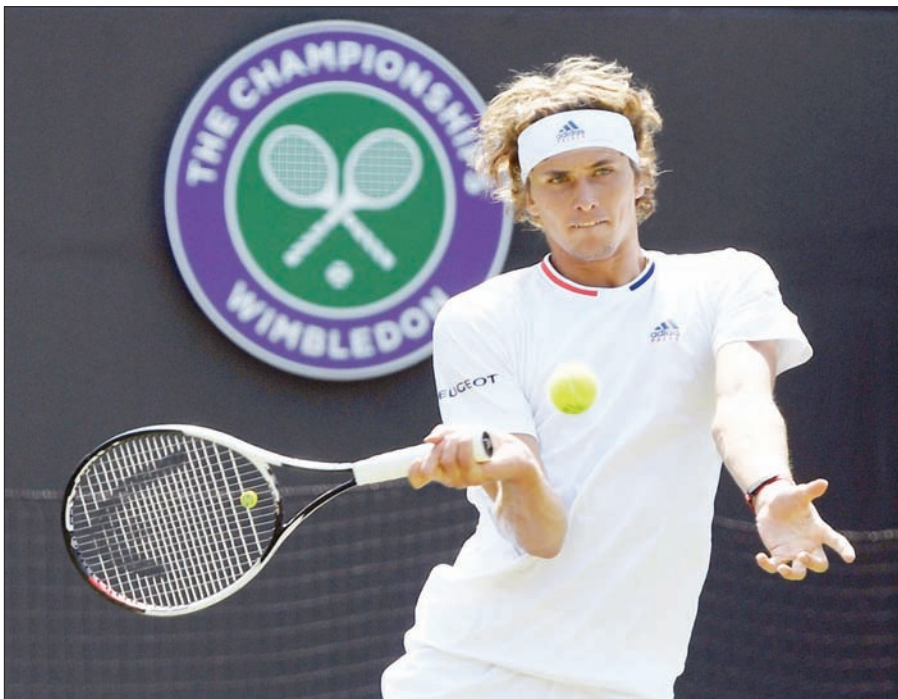
ألكسندر زفيريف

لندن، «الشرق الأوسط» تجنّب الألماني ألكسندر زفيريف المصنف رابعا الخروج المبكر من الدور الثاني لبطولة ويمبلدون الإنجليزية لكرة المضرب، فالثلة الإنجليزية الأربع الكبري، بفوزه المتأخر على الأميركي تايلور فريتز في مباراة من خمس مجموعات بدأت الخميس واستتمت الجمعة بسبب الضلال. وكان زفيريف (21 عاماً)، الثالث عالمياً، متأخراً بمجموعتين لواحدة 6 - 4 و 5 - 7 و 6 - 7 (صفر - 7) الخميس، قبل أن تتوقف المباراة، لكنه قلب الأمور أمس الجمعة بعد أن تفوق بشكل تام على فريتز (20 عاماً)، وحسم المجموعتين الثالثة والرابعة بسهولة 6 - 1 و 6 - 2. ولتقي زفيريف في الدور الثالث اللاتفي أرنستس غوليس في محاولة لبووغ ضمن النهائي، كما فعل العام الماضي في أفضل نتيجة له في البطولة. ويبقى أفضل إنجاز لزفيريف في البطولات الأربع الكبرى بلوغه ربع النهائي في رولان غاروس الفرنسية الشهر الماضي. وقال الألماني: «التوقف أمس مع تأخر مجموعتي لجموعة لم يكن شعوراً جيداً،