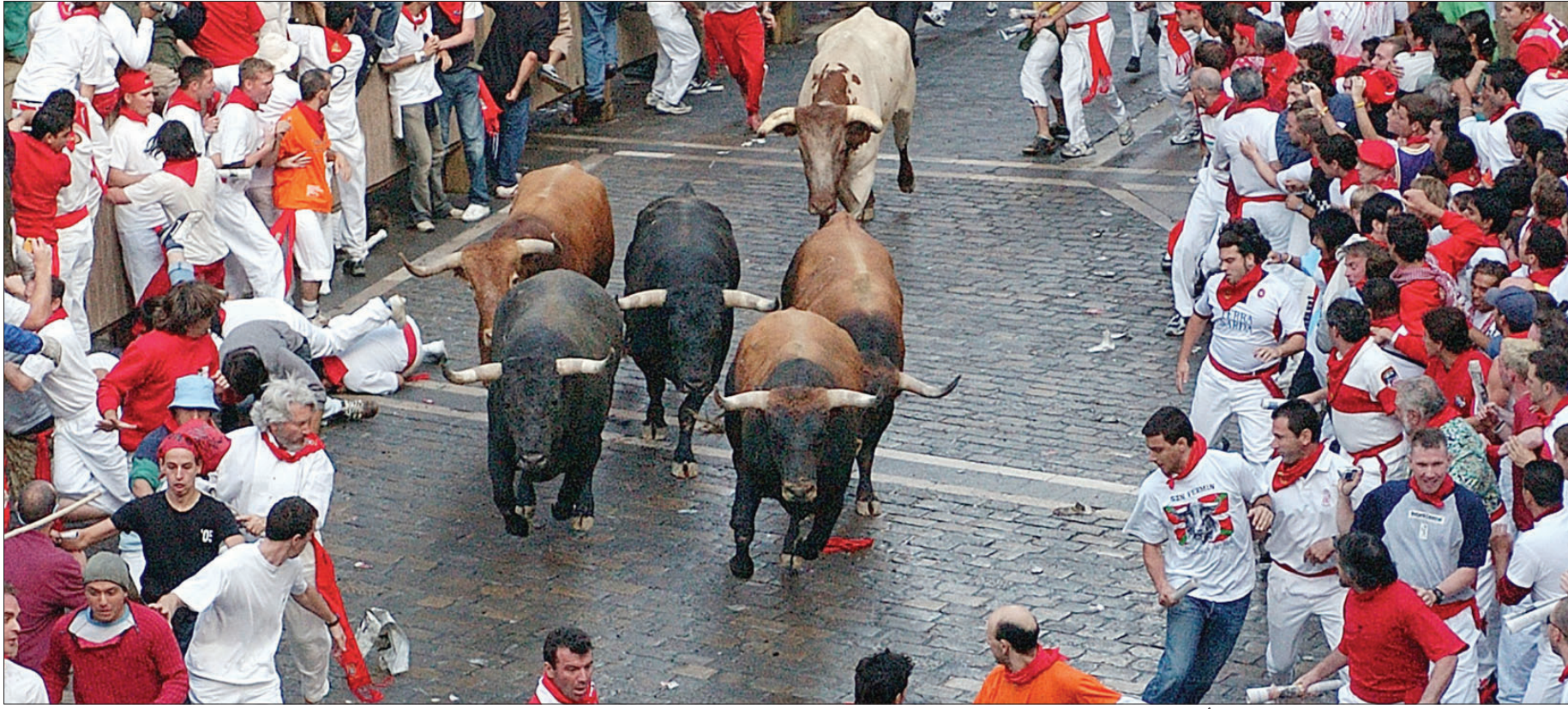
سيل من القمصان والسرراويل البيضاء والمحارم الحمراء في طرقات مدينة بامبلونا الإسبانية بمناسبة احتفالات «سان فرمين»