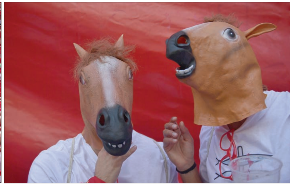
أقنعة على هيئة رؤوس ثيران تقريبا للحيوانات الهائجة