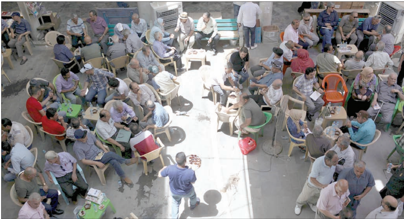
عراقيون في استراحة في شارع المتنبي الشهير وسط بغداد (رويتز)

فيما يتجه البرلمان العراقي إلى تمديد عمله لحين ظهور نتائج الانتخابات، على أثر موافقة المحكمة الاتحادية على التعديل الثالث لقانون الانتخابات، القاضي بالعد والفرز البيدي بدلاً من الإلكتروني، فإن القرار الصادر عن المحكمة الاتحادية أربك على نحو واضح عملية تشكيل التحالفات لتكوين «الكتلة الأكبر»، التي يريخ أحد أعضائها لتولي رئاسة الحكومة.