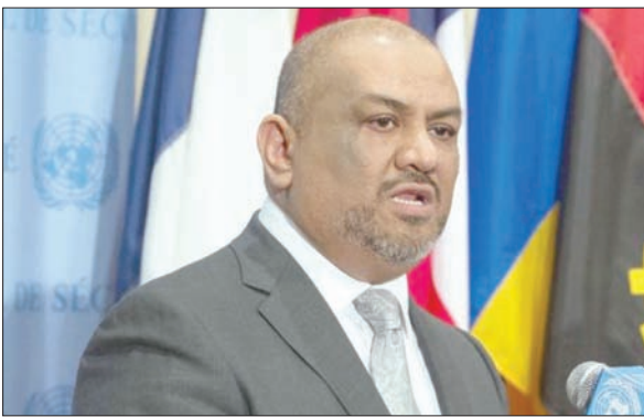
وزير خارجية اليمن خالد اليمني

وأوضح وزير الخارجية اليمني أن «بقاء ميناء الحديدية بأيدي الميليشيات لتلقي السلاح والصواريخ من إيران هو خطر كبير على أمن واستقرار دول المنطقة