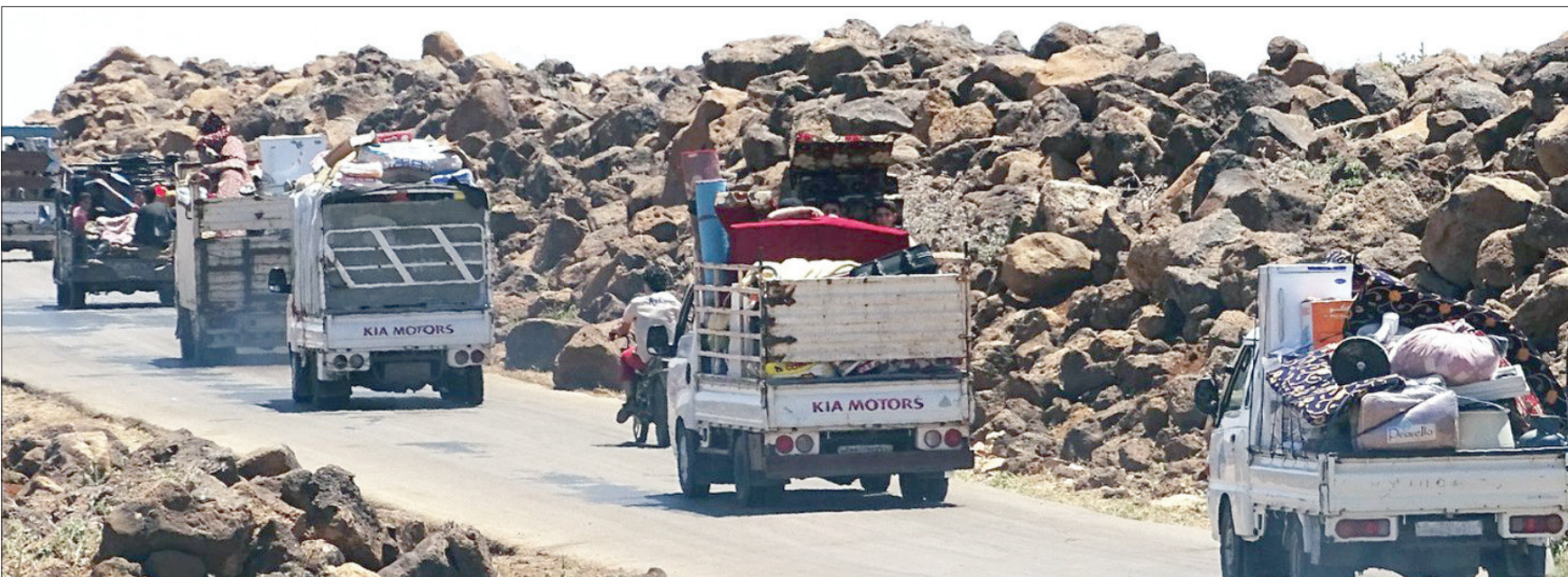
نازحون جنوب سوريا (تباً)

في ظل الاتفاق المتفاوض عليه بشأن الجنوب الغربي السوري، يمكن لجميع الأطراف الولاء بالحد الأدنى الممكن من احتياجاتها، أو على أدنى تقدير قنابي سنيارويها أسوأ الحالات المعنية بكل منها. وفي هذا السياق، ينبغي على عاة خفض التصعيد في الجنوب السوري إعادة المفاوضات الثلاثية إلى مرحلة ما وراء إطار عمل مركز عمان للمراقبة والتصعيد القائم والعمليات ذات الصلة به باعتبارها وسيلة الوصول إلى اتفاق أكثر تطوراً واستدامة، وتجنب الخطوط العريضة للاتفاق واضحة بصورة نسبية، حتى وإن كانت التفاصيل، بما في ذلك التوقيت واليات التنفيذ، لا تزال قيد التفاوض حتى الآن. أولاً، ورغم كل