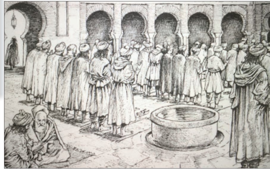
رسم توضيحي لإحدى قاعات مسجد في الأندلس