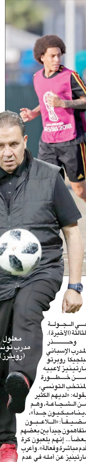
معلول مدرب تونس (رويترز)

ويذكر أن أفضل نتيجة لبلجيكا في كأس العالم كانت المركز الرابع في مونديال المكسيك 1986، عندما سقطت في دور الأربعة أمام الأرجنتين بثلاثية أسطورتها دييغو مارادونا، الذي قادها إلى اللقب العالمي في تاريخها. وتلقى مارتينيز نياً ساراً أمس، باستئناف قطب دفاع برشلونة عقب تعافيه من الإصابة في الفخذ، فيما من المتوقع أن يستأنفها القائد فانسان كومباني مجدداً في التدريب الأخير قبل اللقاء، وكلا اللاعبين، 32 عاماً، كانا يعانيان من إصابة في الفخذ، وتم تثبيتهما في التشكيلة الرسمية في اللحظة الأخيرة.