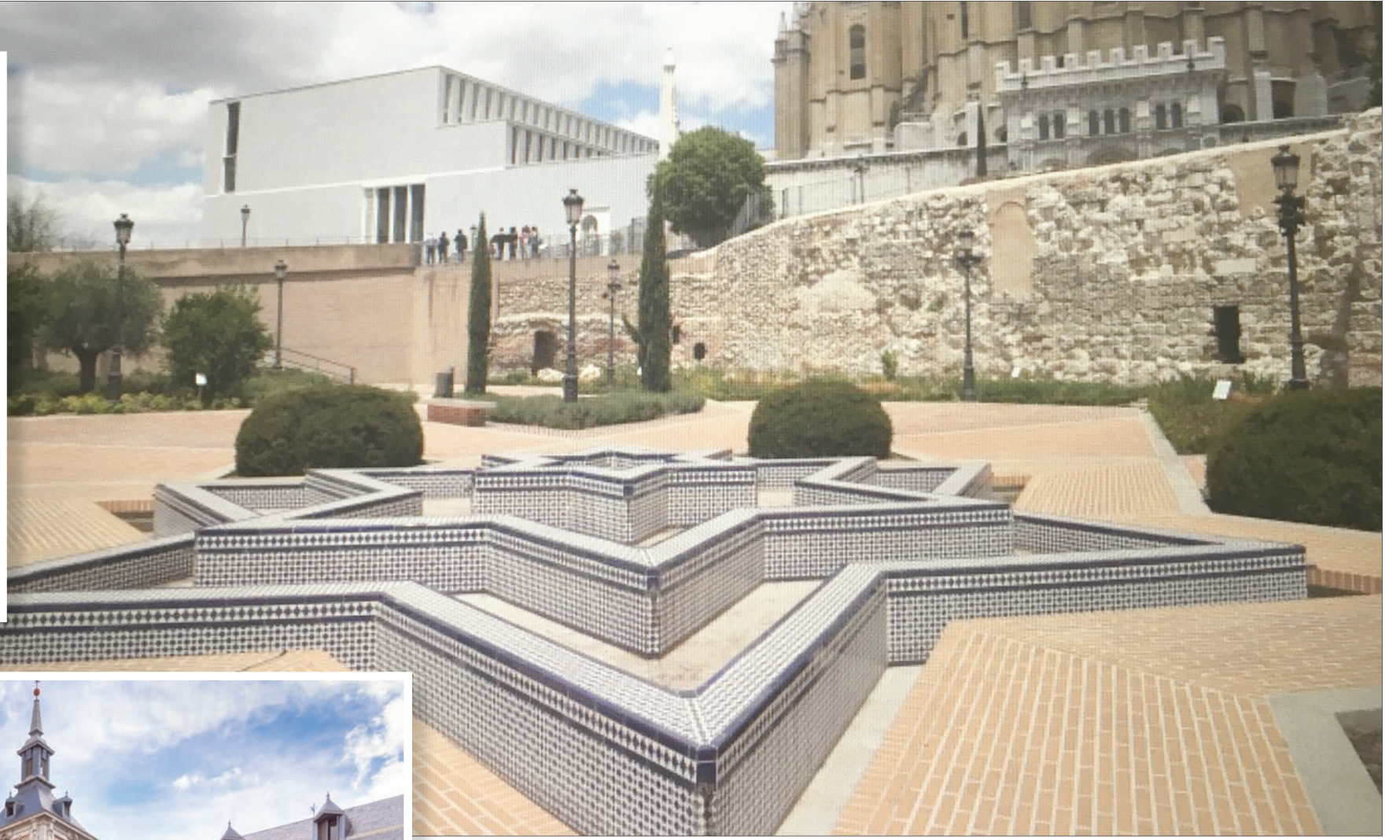
حافظت إسبانيا على الطراز الإسلامي على مدار السنين