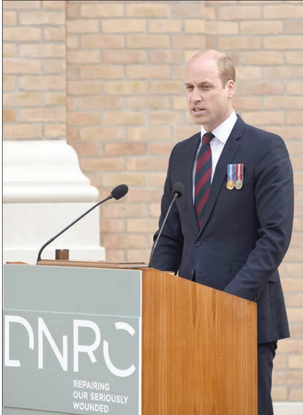
الأمير ويليام

للأمير تشارلز أو الملكة، لكن رفض طلبنا... اعتقد أن الأمر لا يتعلق بالملكة أو الأمير وإنما بوزارة الخارجية. لا أعرف لماذا غيروا رأيهم، ربما حان الوقت». وأضاف: «ربما أدركت وزارة الخارجية أنه لا يوجد سبب في الماضي» لرفض مثل هذه الزيارة، وشدد قصر كنسينغتون على «الطبيعة غير السياسية لدور الأمير، وهو أمر ينطبق على كل الزيارات الملكية إلى الخارج». لكن الإشارة في البيان الرسمي لجدول الزيارة إلى القدس الشرقية على أنها «في الأراضي الفلسطينية المحتلة» أثارت غضباً شديداً لدى بعض السياسيين الإسرائيليين اليمينيين. إذ كتب وزير شؤون القدس زئيف ريفلين من حزب الليكود، الذي يترأسه رئيس الوزراء بنيامين نتنهاو: «القدس الموحدة كانت عاصمة إسرائيل منذ أكثر من 3 آلاف سنة... وأي تحريف في البيان حول هذا الأمر أو خال الجولة، لن يغير الواقع». وسبق أن قام أعضاء آخرون من عائلة الأمير ويليام بزيارات غير رسمية إلى إسرائيل والقدس الشرقية في السابق. لكن لم يسبق لأحد من العائلة الملكية البريطانية بهذا المستوى الرفيع أن قام بزيارة رسمية إلى إسرائيل منذ قيام الدولة العبرية في 1948. وتعود