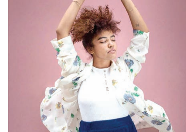
إبريلا مونتيرو فنانة برازيلية وواحدة من اللواتي تخلين عن استخدام أدوات تلميس الشعر

ينتقلان إلى حي لندنية بسكنه البيض في ريو دي جانيرو. يجمع المسلسل بين الأسلوب الكوميدي المبالغ فيه، ومقولات لنيلسون مانديلا، الزعيم المناهض لسياسة التمييز العنصري في جنوب أفريقيا، وتاريخ حقوق الإنسان، وقصص عن العنصرية. عندما جاء وقت اختراع طريقة تصفيف شعرها مثل ستنظير بها في المسلسل قالت أراوجو، إنه كان قراراً سياسياً. وأضافت خلال مقابلة: «عندما نتحدث عن دور التلفزيون خاصة في البرازيل، نرى نظراً لكونه متاحاً للجميع، نرى أن الشعور بالمسؤولية الاجتماعية يمكن أن يغير المبدأ». وتضيف: «لقد اكتشفت البرازيل هويتها. لا تحدث التغييرات الثقافية بين عشية وضحاها. نحن نتم بهذه المرحلة ومن الجميل رؤية ذلك». تميزت أراوجو، خلال الأسابيع القليلة الماضية عن غيرها من العارضات المشاهير ذوات الشعر اللامع اللاتي يظهرن على أغلفة المجلات المنتشرة في أكشاك بيع الصحف والمجلات. وكانت صورتها التي ظهرت على غلاف مجلة «كلوديا» للمرأة تتطلع بتحد إلى العدسة بأبدي متشاكدة وشعر عجري كثيف. ألهمت مشاهدة أراوجو على شاشة التلفزيون، 34 سنة بالتحرر من خصلات الشعر المسترسل منذ أربع سنوات. والآن بلغت ابنتها أنا لوزيا عشر سنوات، وهي المثلثة تاييس أراوجو، وهي أول ممثلة تلعب دور سيدة ثرية ذات شعر مجعد، في مسلسل تلفزيوني ممثلة لأمها. الكوميدي الذي يتناول المصاعب التي يواجهها زوجان من ذوي البشرة السوداء مسيور الحال