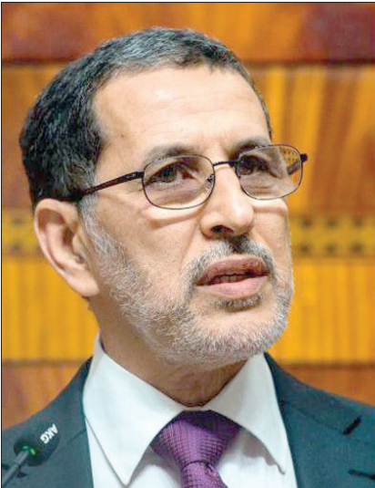
صورة الرجل المغربي الذي انتحل شخصية رئيس الوزراء المغربي (إلى اليسار) للحصول على طاولة في مطعم بروسيا