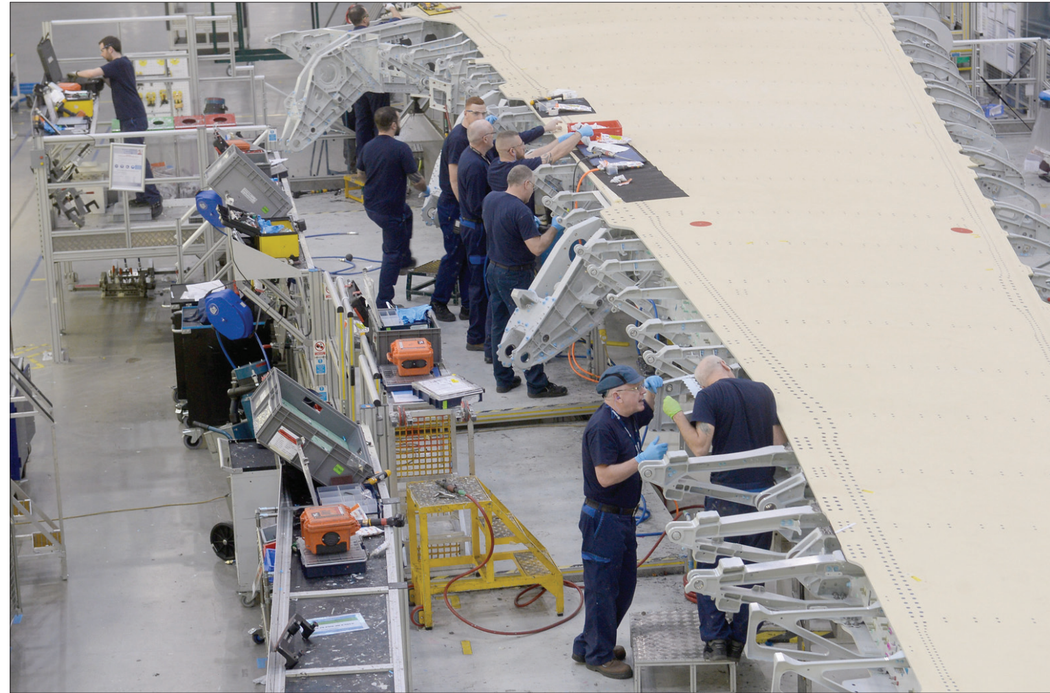
لندن، «الشرق الأوسط»

في البلاد. وقال ستيف تيرنر، المسؤول في نقابة «يونايست»، إن «الناس صوتوا لمغادرة الاتحاد الأوروبي وليس ليفقدوا وظائفهم ومصادر رزقهم على مذهب (بريكست) قاس». وتحديرات «إيرباص» لا تخدم مصلحة ماي المضطرة إلى العمل باستمرار من أجل ردم الهوة بين المشككين في جدوى أوروبا داخل حزبها الذين يريدون قطع كل الجسور مع الاتحاد وانصار الإبقاء على علاقات وثيقة. وبين هؤلاء الأخيرين النائب المحافظ ستيفن كراب الذي تدخل قائلا، إن «مصنع (إيرباص) على