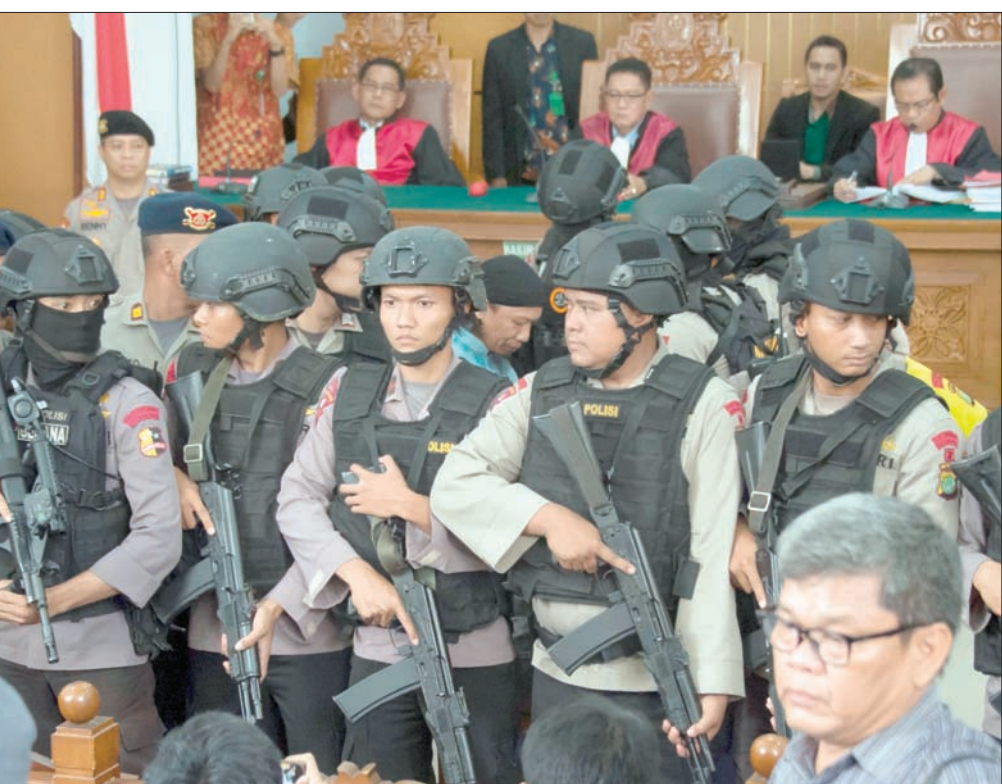
رجال مكافحة داخل المحكمة في جاكرتا خلال مثول المتهم أمامها

ومفوضية للشرطة ما أدى إلى مقتل 12 شخصاً، وقتل المهاجمون الـ13 أيضاً. لكن عبد الرحمن لم يتهم بهذه الهجمات. ويسرى مراقبون أن الداعية الإسلامي تمكن خلال اعتقاله منذ 2010 من تجنيد ناشطين لتنظيم داعش. وتشير وزارة الخارجية الأميركية إلى أن «جماعة أنصار الدولة» التي أنشئت في 2015 تضم أكثر من 20 جماعة متطرفة بايعت جميعها زعيم تنظيم داعش أبو بكر البغدادي. والى جانب اعتداءات جاكرتا في 2016، نفق هذه الجماعة وراء اعتداء آخر وقع في 2017 على محطة للحافلات في العاصمة، قتل فيه ثلاثة شرطيين وجرح نحو 10 آخرين. وتواجه إندونيسيا أكبر دولة في عدد المسلمين بالعالم، منذ فترة طويلة تياراً إسلامياً متطرفاً. وبعد اعتداءات بالي التي أودت بحياة 102، بينهم عدد كبير من الأجانب في 2002، شنت السلطات هجوماً واسعاً على الإسلاميين المتطرفين وأضعفت الشبكات الأخطر بينهم. حسب خبراء، لكن الخوف من صعود هذه الجماعات الإسلامية من جديد تزايد في الفترة الأخيرة. وغادر ممثلات الأوساط الإندونيسية الأصل البلاد إلى الخارج للقتال في صفوف تنظيم داعش.