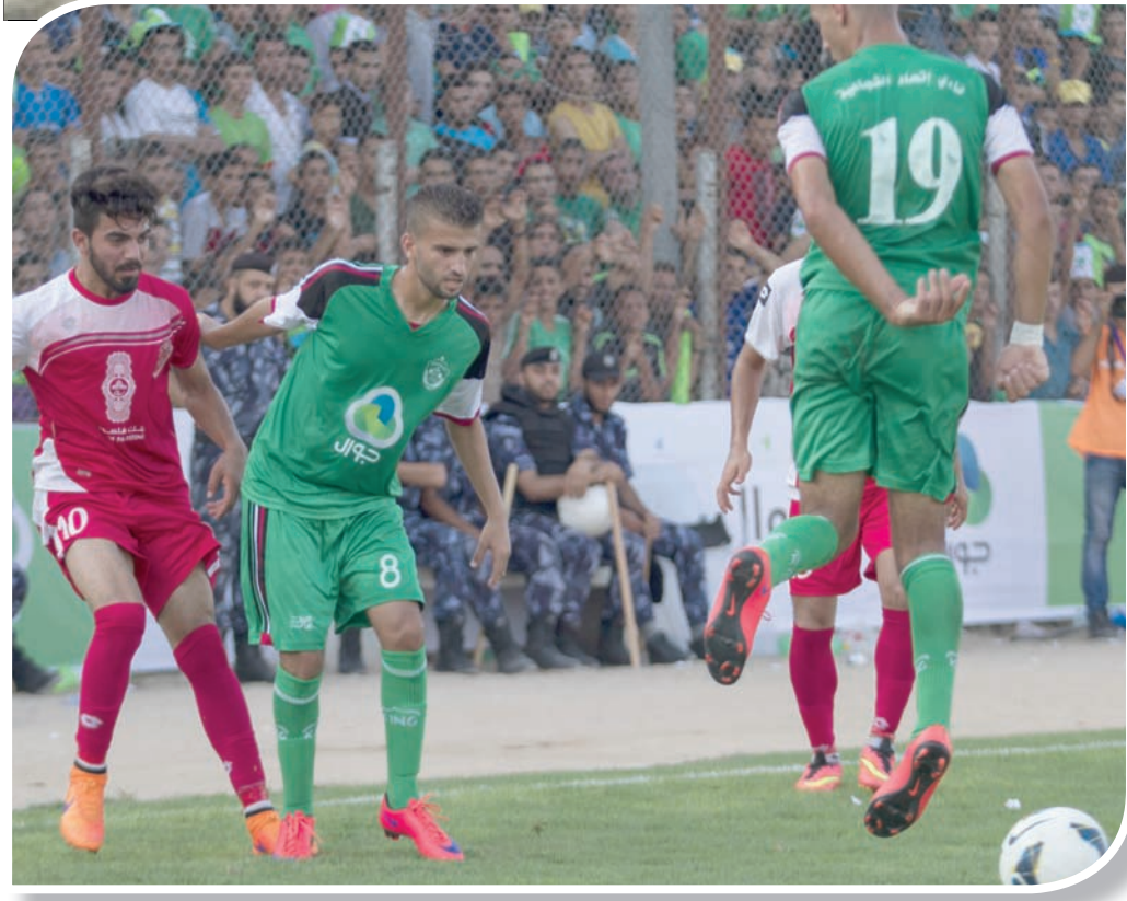
فريق الشجاعة (غزة) وفريق الأهلي (الخليل) خلال مباراة جرت على ملعب اليرموك بغزة في 2015

وأكد الفرنسي فايان أولييه في كتاباته، أن الرياضة وسيلة قمع، وأن قطاعها هو مجال لنمو الرأسمالية، وأنه مصنع للأدلة الأجساد، ونمذجتها. وأصدر الكتب التالية: «الوهم الرياضي: سوسيولوجيا الأيديولوجيا الشمولية»، «زمت كرة القدم»، «محللاً فيه، وبالتعاون مع هنري فوغران، مونديال عام 2002، بحيث قدمه كاحتفالية لتكريس الجاعة السياسية والاقتصادية في العالم: «الوهم الكروي: نقد لمظاهره الشمولية»، «مرض الـPCF الطفولي»؛