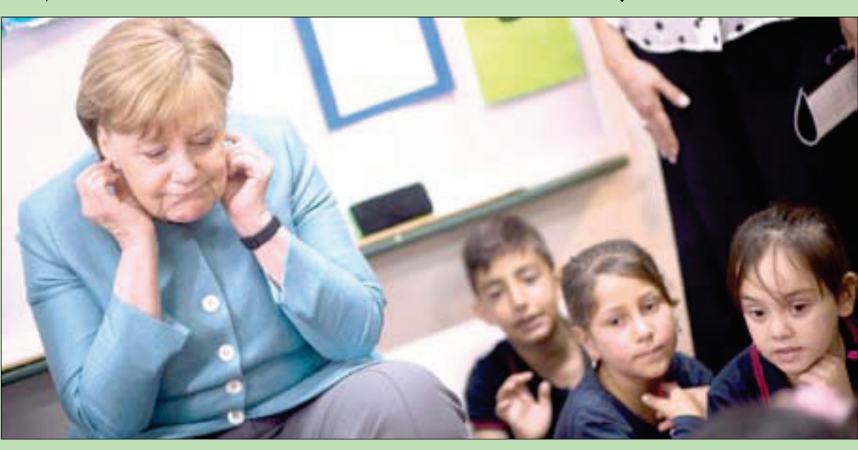
المستشارة الألمانية أنجيلا ميركل خلال زيارتها المدرسة يتلقى التعليم فيها أطفال لبنانيون وسوريون في بيروت أمس (أ.ب)

تندن: إبراهيم حميدي دعت واشنطن ممثلي فصائل المعارضة إلى عدم الرد على «استفزازات» قوات النظام، التي استأنفت مروحياتها أمس قصف ريف درعا جنوب البلاد بالبراميل المتفجرة، وذلك لإعطاء فرصة لـ«حل دبلوماسي» يحافظ على اتفاق «خفض التصعيد» بين واشنطن وموسكو وعمان. وأشارت مصادر دبلوماسية إلى أن ملف الجنوب السوري سيكون حاضراً في قمة محتملة في فيينا بين الرئيس الأميركي دونالد ترمب والرئيس فلاديمير بوتين خلال جولة ترمب في أوروبا الشهر المقبل. ووجهت واشنطن رسالة نصية إلى المعارضة أسلحة جاء فيها: «نعمل حالياً للحفاظ على وقف النار بالقوات الدبلوماسية، ونبدأ جهوداً جبارة في سبيل تحقيق ذلك. نتوجه إليكم بضرورة عدم الرد على الاستفزازات، لأن ذلك لا يؤدي سوى إلى تسريع السيناريو الأسوأ للجنوب السوري وتقويض جهودنا». وأضافت الرسالة، التي حصلت لـ«الشرق الأوسط» على نصها: «النظام يحاول استفزازكم بالارتال والتصريحات لإيجاد ذريعة لهجوم الجنوب، ولا يمكن أن نعطي هذا العذر». إلى ذلك، قتل جندي سوري واحد على الأقل وأصيب سبعة آخرون بجروح مساء أول من أمس في غارة شنها التحالف الدولي بقيادة واشنطن لصد هجوم من ميليشيات دمشق على معسكر السور لحقوى الأميري، بحسب المرصد السوري لحقوق الإنسان». (تفاصيل ص 6 و 7)