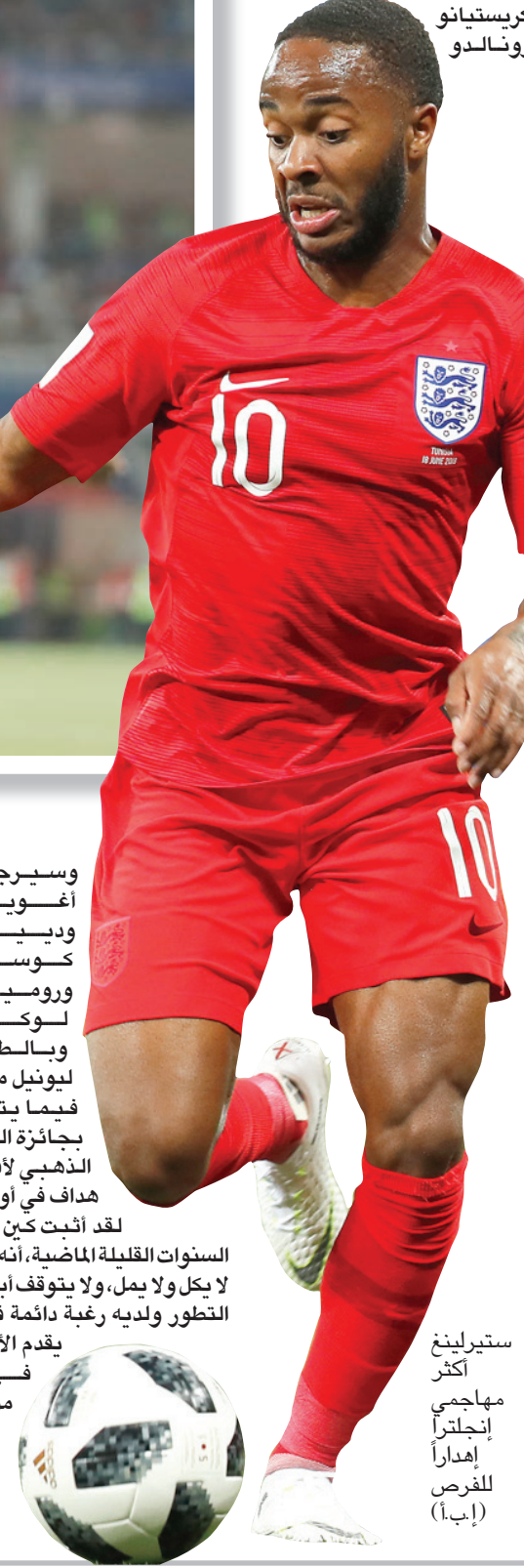
ستيرلينغ أكثر مهاجمي إنجلترا إهداراً للفرض

في الواقع، يتبع عدد كبير من المديرين الفنيين طريقة ساوثغيت نفسها فيما يتعلق بلاعبهم البارزين، لكننا في هذه الحالة نتساءل هل كان من الضروري أن يمتنع ساوثغيت عن الإشادة بكين، الذي لا يبدو أنه من نوعية اللاعبين الذين يكفون بما حققوه حتى يصبح المهاجم رقم واحد في عالم الساحرة المستديرة؟ ونجح كين في تسجيل أهداف في سبع مباريات من آخر ثماني مباريات له بقميص المنتخب الإنجليزي، وهو أول لاعب إنجليزي ينجح في ذلك منذ جيمي غريفيز في موسم