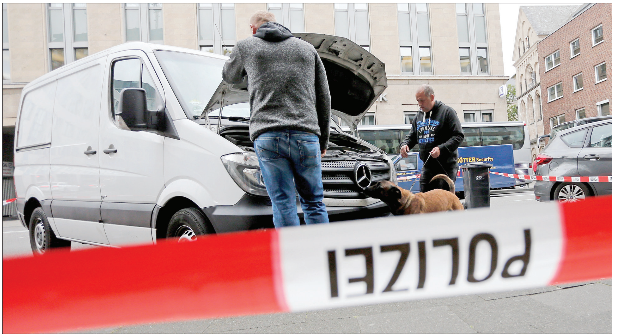
رجال الشرطة الألمانية يفتشون شاحنة المشبوه أمام الكاتدرائية