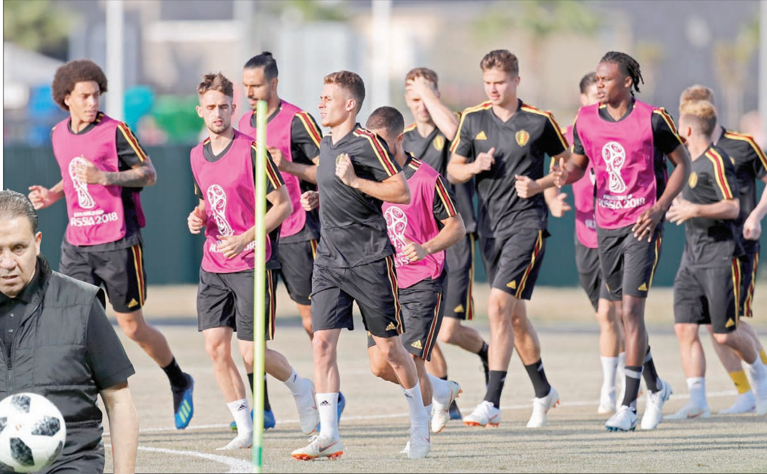
المنتخب البلجيكي المدجج بالنجوم يمثل خطراً على تونس اليوم