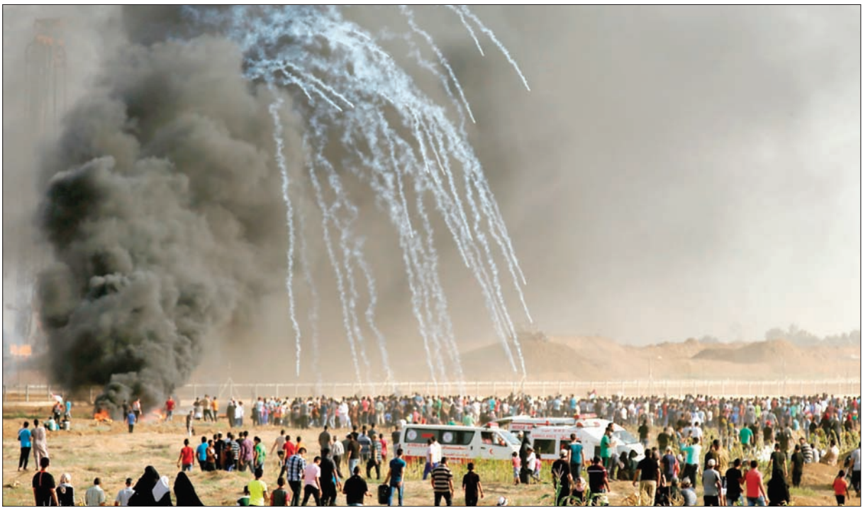
جانب من الاحتجاجات التي نظمها الفلسطينيون على طول حدود شمال وشرق قطاع غزة أمس