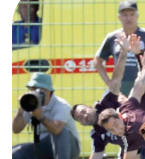
لاعبو المكسيك متحفزون لمواجهة كوريا

ويتطلع أوزوريو إلى المزيد من الهزيم، الذي سجل هدفين في شباك ألمانيا، كما ينطعم إلى تائق النجم خافيير هيرنانديز «تشنيتشاريتو»، الهدف التاريخي