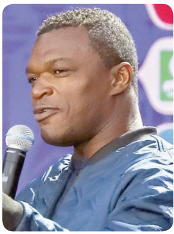
ديسايي أحد رموز منتخب فرنسا بطل العالم في 98

وفي المقابل، قدم المنتخب البلجيكي أداءً مقنعاً أمام بنما، وبدأ أن رفاق إيدن هازارد قد أصبحوا أكثر نضجاً وخبرة بعد الأداء المخيب للألمان الذي قدمه المنتخب البلجيكي