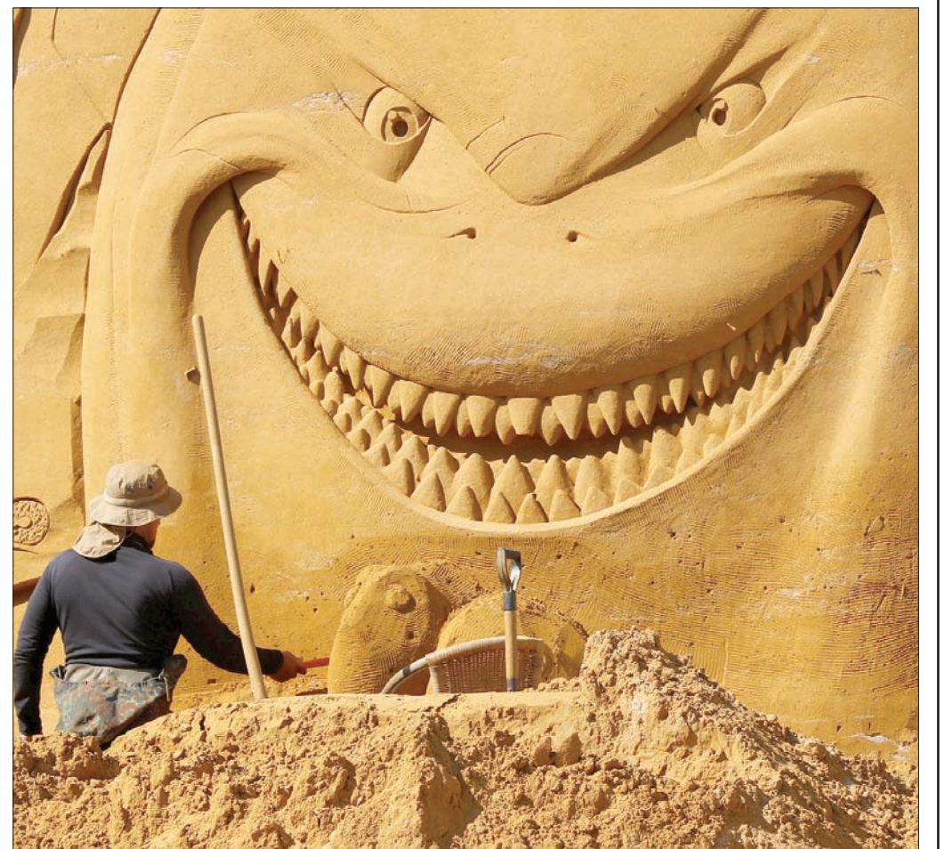
نحات يضع المسات الأخيرة على تمثال رملي قبل افتتاح مهرجان «سحر الرمال» اليوم في أوستوند ببليجيكا

وقضى 34 فناناً عالمياً أربعة أسابيع في إنجاز الأشكال الفنية باستخدام حوالي ستة آلاف طن من الرمال استعداداً للمهرجان المسجل في موسوعة غينيس للأرقام القياسية كأكبر مهرجان للأشكال الرمالية في العالم. «فايندينغ نيمو».