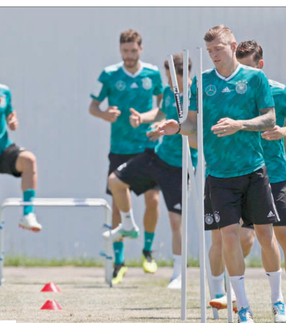
المنتخب الألماني يستعد لمواجهة السويد وهو تحت ضغط هزيمة الافتتاح

لكن المهاجم توماس مولر تطرق إلى الفترة التحضيرية والعروض المتواضعة، التي تضمنت الخسارة أمام البرازيل في برلين (صفر - 1)، والجارة المتواضعة النمسا (1 - 2)، معترفاً: «اعتقدنا، باستخفاف نوعاً ما، أنه عندما تبدأ البطولة سنستعيد حيويتنا ووقتنا المعتاد، يمكننا القول إن تقييمنا للموقف كان خاطئاً». وفي الطرف المقابل، تحول السويد على الجناح إميل فورسيبرغ، الذي أمضى موسمين جديدين مع فريق لايبزيغ الألماني، حيث لعب بجوار مهاجم منتخب