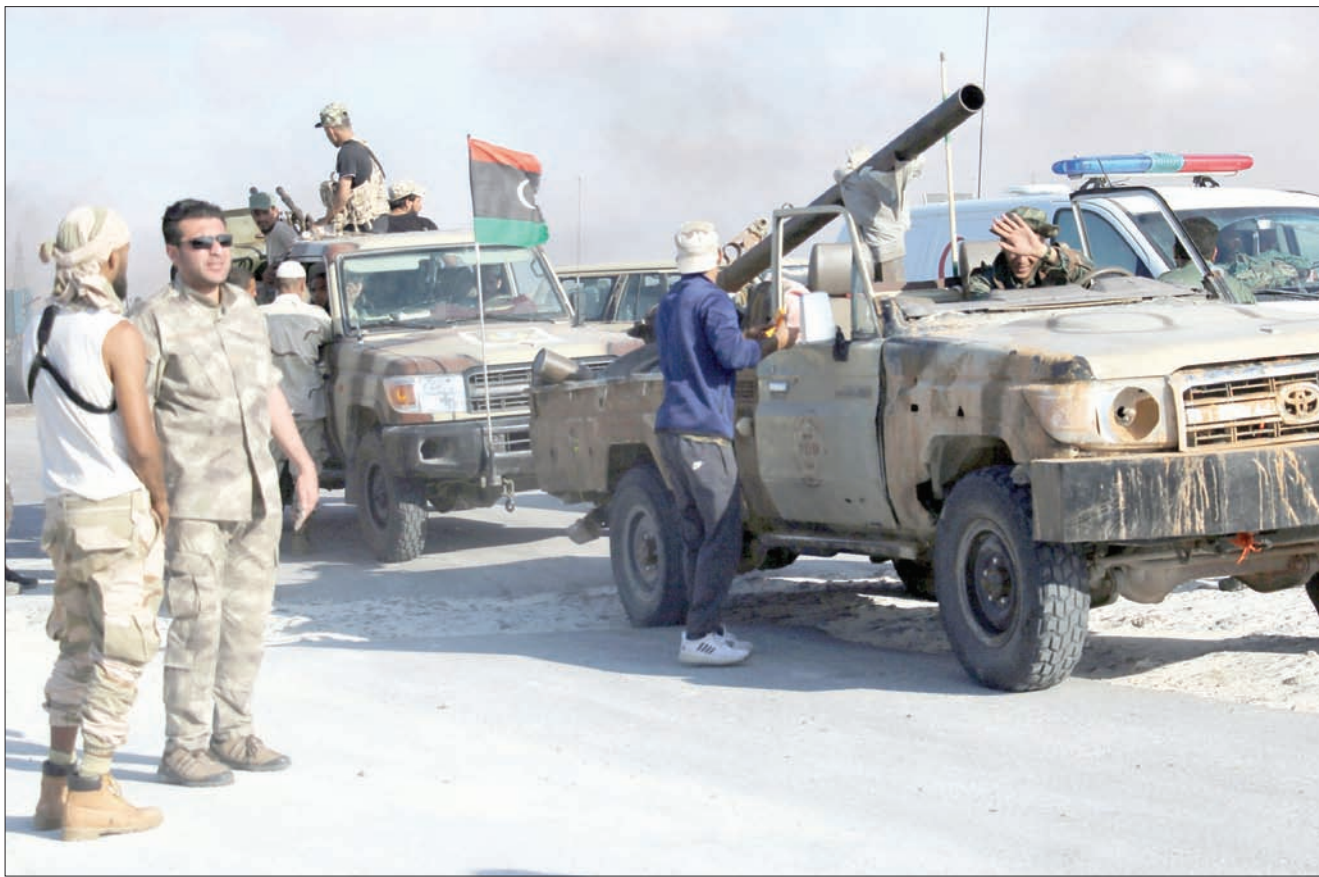
عناصر من الجيش الليبي يرفعون العلم الليبي فوق سيارتهم بعد استعادة السيطرة على ميناء راس لانوف

ومنذ أكثر من عام ونصف العام، لم يطالب فائز السراج، رئيس المجلس الرئاسي لحكومة الوفاق الوطني في طرابلس، برفع حظر السلاح عن بلاده. لكن سياسياً ليبيا أزعج تحوّل المجتمع الدولي من رفع الحظر عن توريد السلاح لأموار عدة، «تتعلق بأي فريق تدعّمه، هل الجيش الوطني في الشرق بقيادة المشير خليفة حفتر؟ أم الجيش في الغرب التابع لحكومة