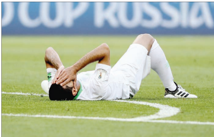
الجاسم متأثراً بإصابته أمام الأوروغواي (الشرق الأوسط)

ما أعلن المستشار تركي آل الشيخ، رئيس الهيئة العامة للرياضة، بعد المباراة الأولى للمنتخب السعودي في مونديال روسيا أمام المنتخب المستضيف، والتي انتهت بخسارة كبيرة للأخضر بخمسة أهداف نظيفة... وقال القحطاني: إن الكرة في ملعب «بي إن سبورت» والمنظمة العالمية ومنظمي المسابقات الدولية، فالاحتكار القطري أصبح كارثة لمتابعي كرة القدم، ونحن هنا نطالب بالتدخل لKسر الاحتكار الذي تقوم به beIN SPORTS؛ حتى لا تتفاقم مشكلات النقل التلفزيوني أكثر، كما نطالب بتفعيل المواثيق الأولمبية بعدم استغلال المناسبات الرياضية لترميم أجندتها السياسية، حيث المواطنون السعوديين وأشقاقتهم العرب الذين لم يرغبوا في أن يكون هناك ربط للخلافات السياسية في أروقة الرياضة؛ وهو ما أفضى إلى