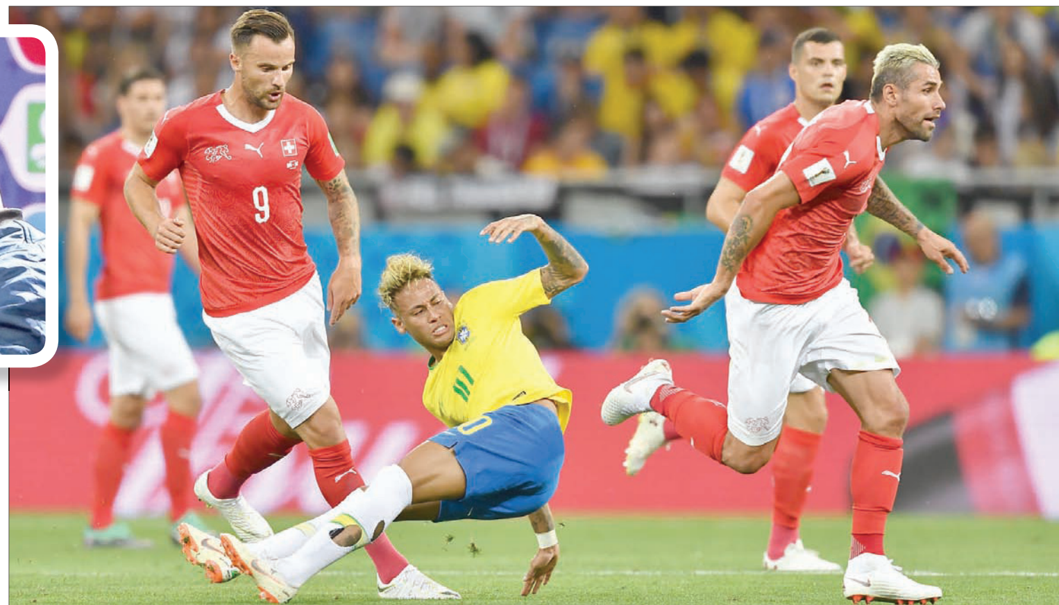
نيمار (في الوسط) استعرض كثيراً في مباراة البرازيل وسويسرا