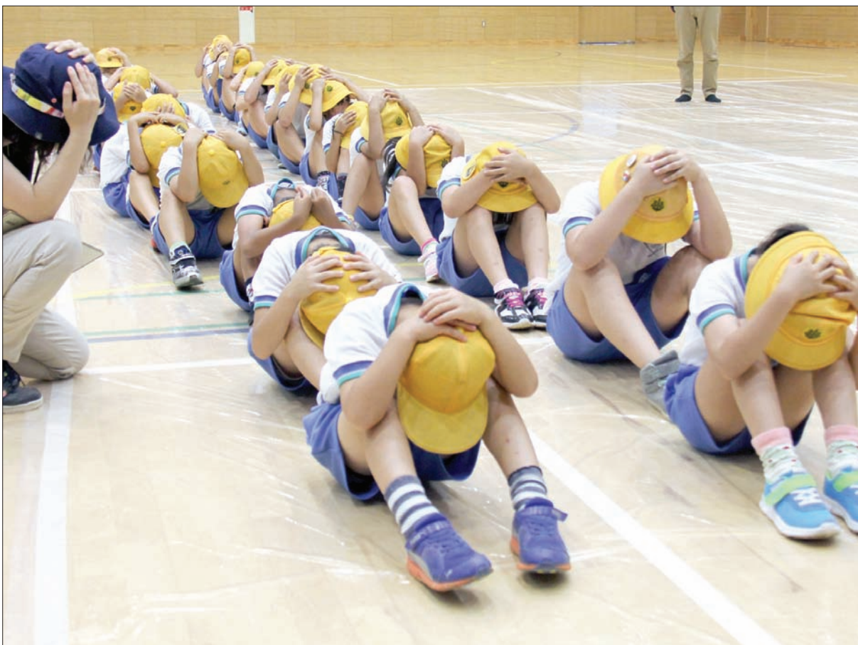
طلاب المدارس اليابانية يشاركون في عمليات التدريب على الإجلاء في يوليو 2017 بعد إطلاق كوريا الشمالية صواريخ باليستية باتجاه الجزر اليابانية. وأمس أعلنت طوكيو أنها بصدد تعليق هذا النوع من التدريبات

أجرت اليابان 29 تمريناً في جميع أنحاء البلاد على عمليات إجلاء السكان تحسباً لحدوث صواريخ باليستية اعتادت كوريا الشمالية على إطلاقها منذ مارس (آذار) عام 2017.