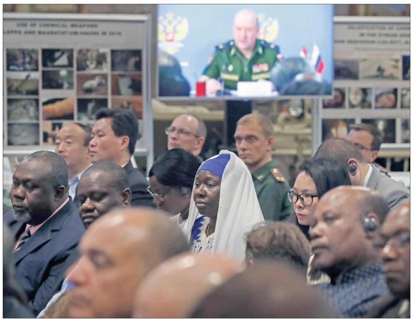
دبلوماسيون أجانب في موسكو يستمعون إلى إيجاز من ناطق باسم وزارة الدفاع الروسية أمس

وفي مقال نفه صحة المعطيات الدولية، قال المسؤول الروسي أن «ناشطي (الخوذ البيض) والمبعوثون في مكان الهجوم المزعوم قبل الإعلان عن حدوثه»، ليس قنبلة كيماوية. وقال، إن «الهجوم المزعوم في دوما بشكل تكراراً مسجحة خان شيخون» التي شاركت فيها أيضاً مجموعة «الخوذ البيض». مضيفاً: إن المنظمة استخدمت في 4 أبريل (نيسان) 2017 في خان شيخون قنبلة متفجرة وليس أسلحة كيماوية؛ «لبليل حجم الحفرة التي، ظهرت في مكان الهجوم الكيماوي المزعوم». كما أشار إلى أنه «تم العثور على