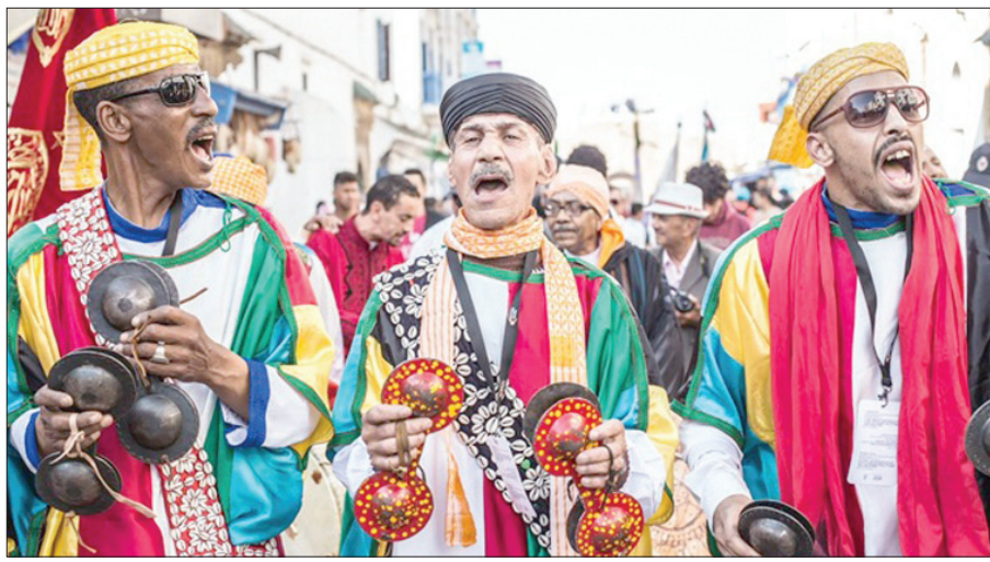
من افتتاح الدورة الـ 21 لمهرجان «كناوة» بالصويرة