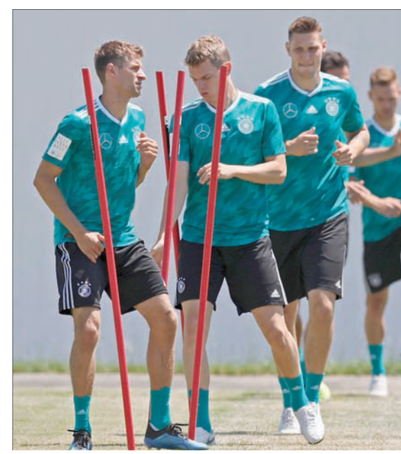
لاعبو المكسيك متحفزون لمواجهة كوريا

لكن ألمانيا لم تخسر في آخر 11 مواجهة ضد السويد (6 انتصارات، و5 تعادلات)، فيما يعود الفوز