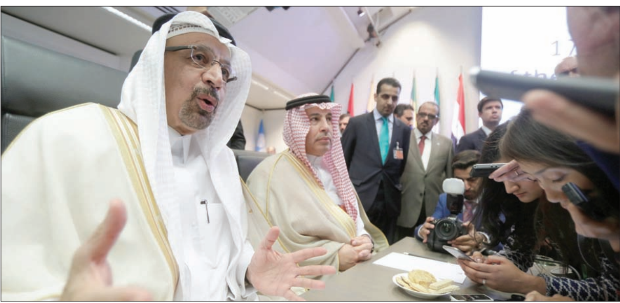
وزير الطاقة السعودي خالد الفالح في ختام الاجتماع نصف السنوي للمنظمة أمس

حين تستطيع فنزويلا زيادة إنتاجها من النفط مليون برميل يوميا بنهاية العام، في إطار مساعيها لاستعادة الإنتاج الذي خسرت، فإن وزير النفط قال أيضاً إن هذا الهدف سينطوي على «تحدي» لشركة «بي دي في إس إيه» الحكومية. وقال الرئيس نيكولاس مادورو الشهر الماضي إن «بي دي في إس إيه» ستظل تهدف إلى زيادة الإنتاج مليون برميل يوميا هذا العام، وإنها ستطلب المساعدة من روسيا والصين و«أوبك». إن لزم الأمر. وهو الإنتاج بسبب العقوبات الأمريكية وأزمة اقتصادية في البلاد، وقال وزير النفط مانويل كيغيدو،