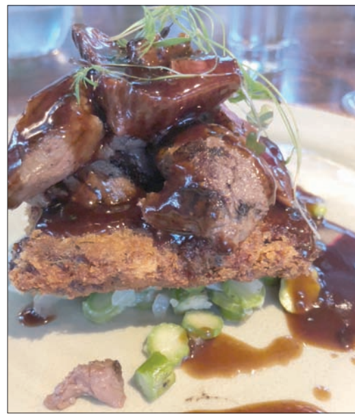
ستيك مع الخضراوات