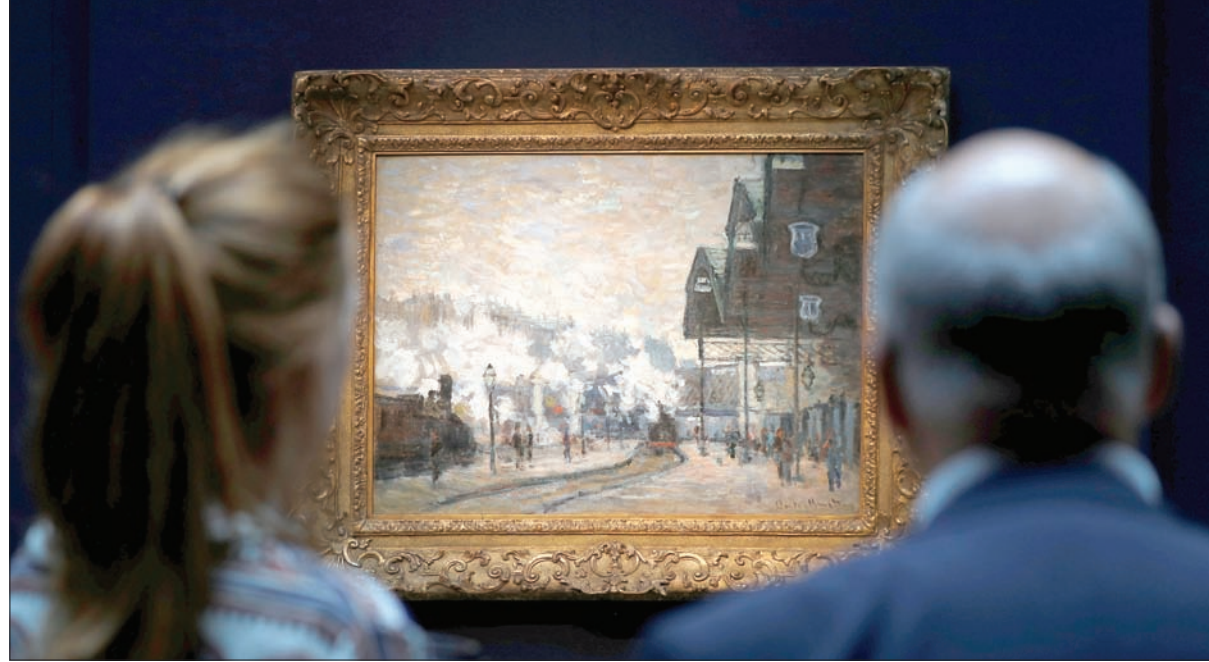
لوحة كلود مونييه «محطة سان لازار» أثناء عرضها بمقر كريستيز بلندن