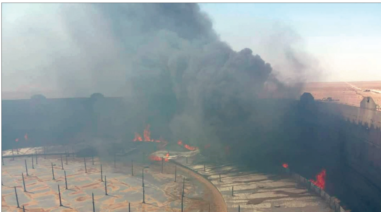
صورة وزعتها مؤسسة النفط الليبية لحريق الخزانات في رأس لانوف

وفي درنة، حيث تواصل قوات الجيش الوطني تحرير مدينة الساحلية من قبضة الميلوطنين في الهلال النفطي والإعلام الحربي التابعة للجيش، لقاءات مع عناصر الجيش وهي تتجول في ضواحي المدينة، مشيرة إلى أنه بعدما وصفته بالحصار الخائف للإرهابيين «لم تعد بحوزتهم إلا أمتار قليلة في هذه المدينة، التي عادت إلى أحضان الوطن»، على حد تعبيرها.