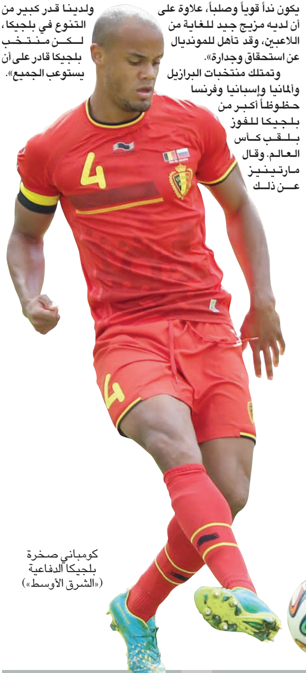
كومباني صخرة بلجيكا الدفاعية