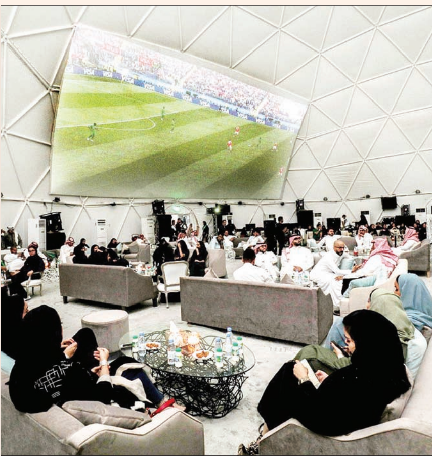
الشاشات العملاقة المخصصة لنقل مباريات المونديال استقطبت المتابعين من الجنسين

شهدت إقبالاً كبيراً تزامناً مع أفراح العيد في العاصمة الرياض، إذ تم تجهيز شاشات عرض عملاقة داخلية وخارجية في الأماكن المخصصة التي حدتها هيئة الترفيه، ووصل عدد الجماهير في خيمة «استاد موسكو» خلال أول يومين من بث المباريات إلى أكثر من أربعة آلاف مشجع أغلبهم من الجماهير السعودية والمصرية والمغربية التي تلعب منتخباتها في المونديال، فيما العدد قابل للزيادة. وتنتظر الجماهير منصة «الرينا» التي ستطلق خلال الفترة من 25 يونيو (حزيران) إلى 4 يوليو (تموز)، وهي عبارة عن منصة خارجية عن المألوف بشاشات عرض عملاقة لمشاهدة مباريات كأس العالم، إضافة إلى عروض ترفيهية وتجريبية صوتية مرئية تقام للمرة الأولى في الخليج العربي.