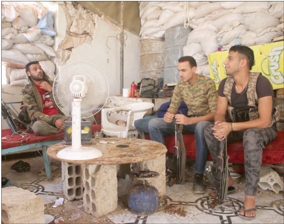
مقاتلون معارضون يحرسون درعا