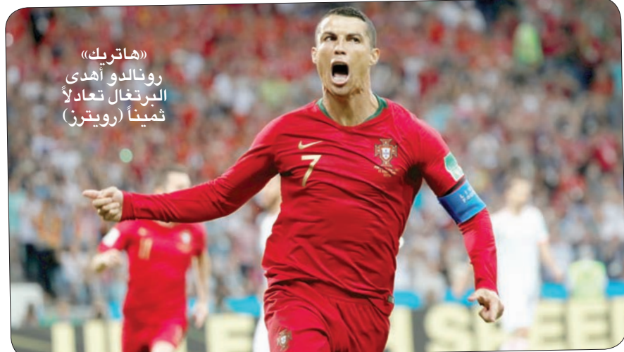
«هاتريك» رونالدو أهدى البرتغال تعادلاً ثميناً

ويملك عقلا رائعا وهذا ما يجعله من ضمن الأفضل في العالم. إنه يحمل الفريق ويشعر بثقة تامة في الفريق. ومن الصعب بعد أداء رونالدو في سوتشي أن يختلف أي شخص على قدرة اللاعب البرتغالي في هز الشباك وبكل تأكيد سنتنظر الجماهير المرزبد. وأثبت الواقع أنه عندما يتعرض رونالدو للضغط فإنه يظهر في اللحظة المناسبة.