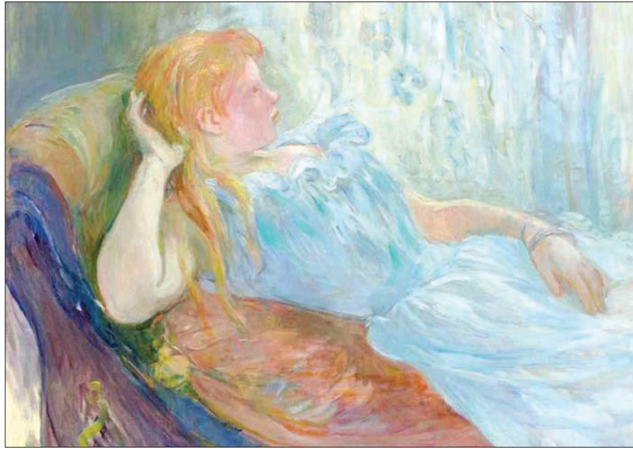
لوحة فتاة جالسة للفنانة بيرث موريسوت