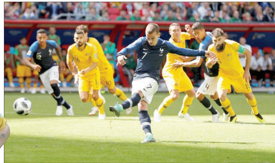
غريزمان يتقدم لفرنسا من ركلة جزاء

ما حصل... الأمور صعبة على الجميع (في الموندنال) باستثناء الروس. يجب أن نقاتل لأن الفرق كلها تستعد جيدا... وجاء الشوط الأول مخيبا بالنسبة للفرنسيين، فبعد بداية واعدة وكرة خطيرة لمبابي من تسديدة قريبة أبعدها الحارس ماتيو راين إلى ركنية في الدقيقة الثانية، بقي المنتخب الأزرق صائما عن تهديد مرمرى المنتخب الأوقياني - الآسيوي الذي سحنت له فرصة صدها