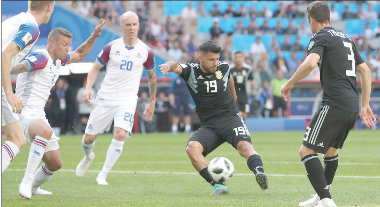
أغويرو يتقدم للأرجنتين

بعدها أظهر ميسي إصرارا كبيرا على التقدم لمتخب بلاده وقدم أكثر من محاولة منها محاولة خطيرة في الدقيقة 79 حيث كاد يسكن الكرة في الشباك لكن سافارون تدخل في اللحظة المناسبة وأطاح بالكرة. وفي الدقيقة 81، راوغ ميسي الدفاع ببراعة ثم سدد كرة قوية يقدمه اليسرى من خارج حدود منطقة الجزاء لكنها مرت بجوار القائم مباشرة. ودفع مدرب الأرجنتين باللاعب غونزلو هيغواين بدلا من ماسيميليانو ميروا في الدقيقة 84، وواصل ميسي تالفه وسدد كرة صاوخية في الدقيقة الثالثة من الوقت المحتسب بدلا من الضائع لكنها مرت بجوار القائم مباشرة، كما تصدى الحائط البشري لكرة سدها من ضربة حرة أخرى في اللحظات الأخيرة، لتنتهي المباراة بالتعادل 1 - 1.