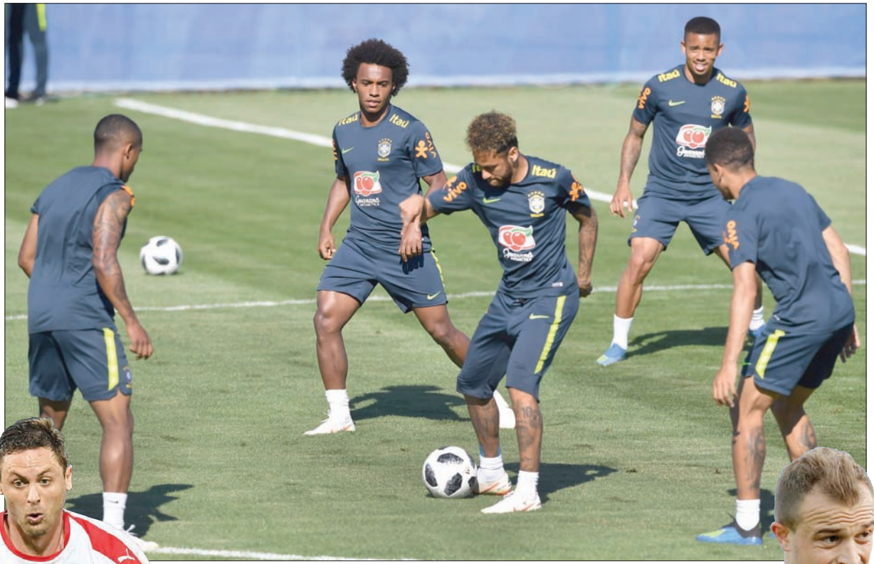
نيمار نجم البرازيل يستعرض بالكرة خلال التدريب الأخير قبل مواجهة سويسرا

المؤهلة، بمواجهة كوستاريكا وصربيا في سامارا. ويقود كوستاريكا الحارس كيلور نافاس بطل أوروبا في آخر 3 سنوات مع ريال مدريد الإسباني، للدفاع عن مرعى المنتخب الذي فاجأ الجميع بوصوله إلى ربع نهائي 2014 قبل أن يخرج بركات الترجيح ضد هولندا.