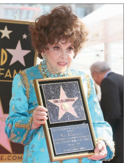
جينا لولو بريجيديا

العلاقة إلى أن أصبح مساعداها ومستشارها الخاص. وترفض بريجيديا ادعاءات الاتهام بأنها ليست سيدة قرارها، ولا تملك القدرة العقلية الكافية للتصرف بصواب، وتؤكد أنها تتحرك بحرية متى وإلى أين شاءت، وتقول: «التقي بمن أريد من الأصدقاء والمعارف متى شئت... وعندما يكون الطقس جميلاً استقل طائرة هليكوبتر وأذهب إلى سردينيا».