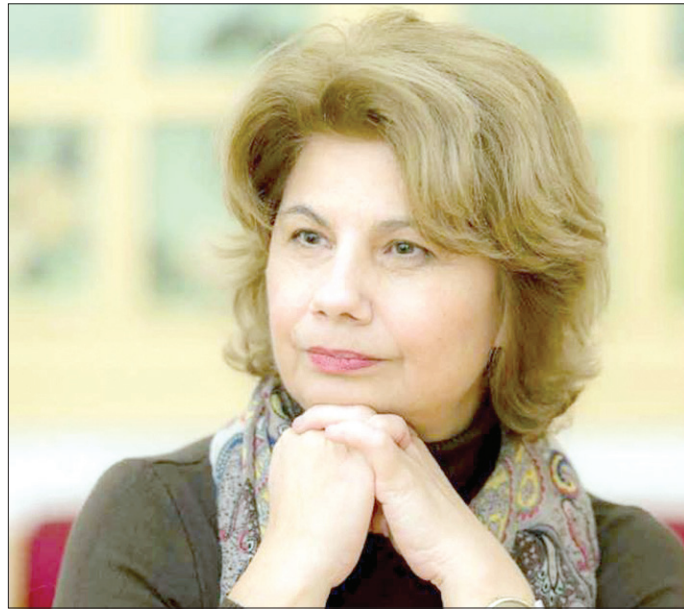
الكاتبة اليونانية بيرسا كوموتسي

بيرسا، «لا تزال موجودة. كانت هناك دوماً ولا تزال ولم تنقطع أبداً. ومؤسسة الثقافة اليونانية فرع الإسكندرية ساهمت بشكل كبير في تنظيم العديد من الأنشطة الثقافية التي تسهم بقوة في التقريب بين الشعبين وبين اللغتين أيضاً». لافتة إلى أن الأرشيف اليوناني بما يشمله من كتب ومطبوعات جُمع ويحفظ في أرشيف تاريخي بالجامعات، وصار حقلاً للبحث تجري دراسته بشكل دقيق ومنفصّل.