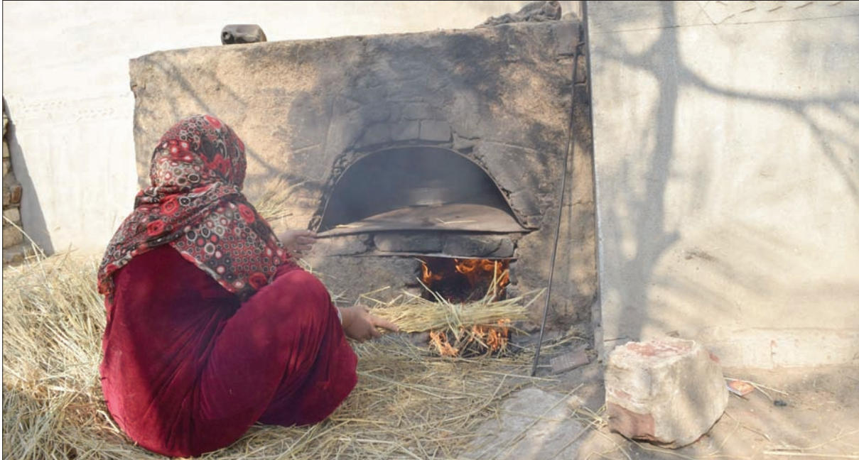
ارتفاع أسعار الحطب والتغيرات الاجتماعية ساهمت في تلاشي العادات المرتبطة بالعيد

اعتاد المصريون على أداء طقوس معينة قبيل عيد الفطر، وبخاصة صناعة كحك العيد والبسكويات، في العشر الأواخر من رمضان من كل عام، وعلى مدار عقود تحكمت العادات والتقاليد في الريف المصري، وفي صناعة الكحك والخبز البلدي المنزلي، وكانت الأفران البلدية الأوفر حظاً والوسيلة الرئيسية لتسوية تلك المنتجات، لكنها تراجعت وانخفضت أعدادها بشدة لصالح الأفران الآلية، ورغم ذلك فإن قطاعاً مهماً من الشعب لا يزال يفضلها عن الجديدة بسبب مذاقها الشهي.