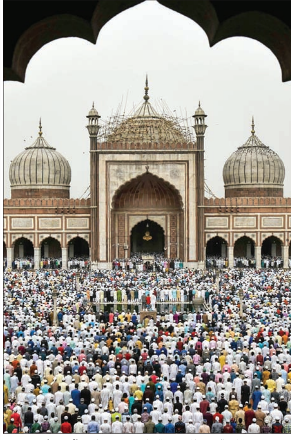
صلاة العيد بالمسجد الجامع في نيودلهي