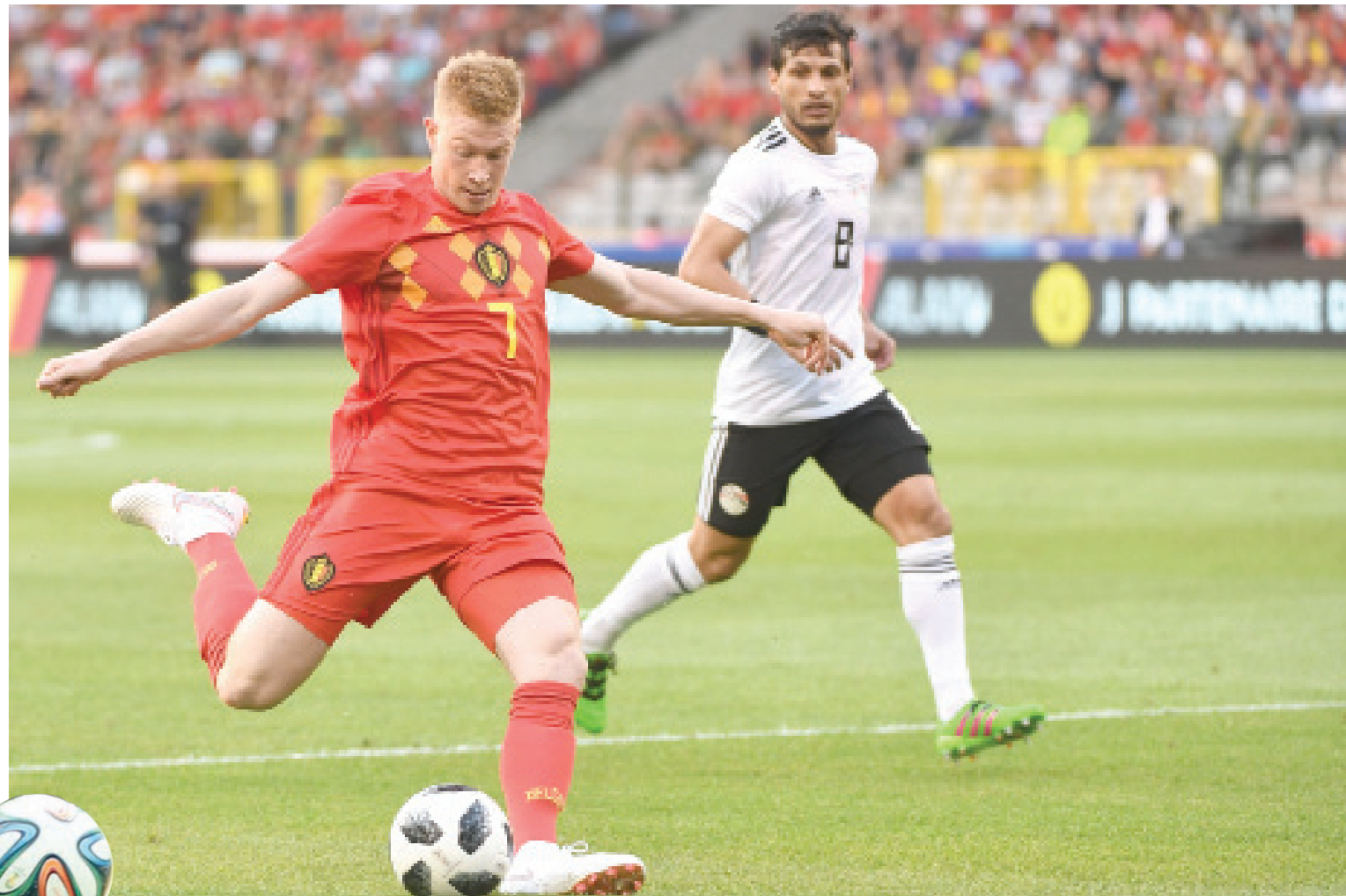
دي بروين تألق في مواجهة مصر الودية

وأضاف مارتينيز: «لقد ساعدت طريقة 3-4-3 ناري تشيلسي على الفوز بالدوري الإنجليزي الممتاز العام الماضي، وقد اعتمدت عليها مع نادي ويغان عام 2009، لكن هذه الطريقة هي مجرد نقطة انطلاق. أنا أهتم كثيراً بالطريقة التي تلعب بها، وطريقة التفكير التي تعتمد عليها. وفي كأس العالم، يتعين علينا أن نظهر أننا مستعدون للمعاناة، ومواجهة المحن والصعاب. هذه المجموعة من اللاعبين ليس لديها جيل سابق يعلمهم كيفية الفوز بالبطولات الكبرى. لذلك، فنحن نذهب إلى المهول، ويتعين علينا أن نتحلى باكبر قدر ممكن من التركيز». ومن بين المنتخبين التي واجهها مارتينيز في المباريات الودية 18 مع بلجيكا، بعد البرتغال هو المنتخب الوحيد الذي يمتلك