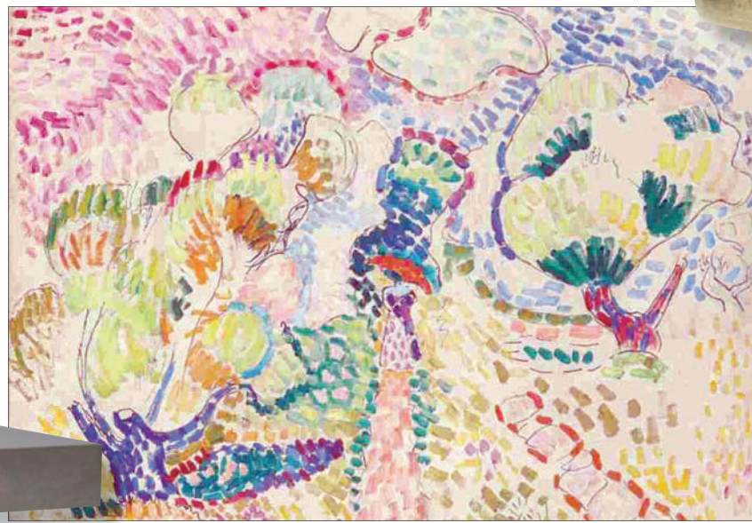
لوحة لهنري ماتيس