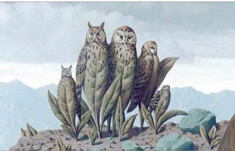
لوحة لرينيه ماغريت