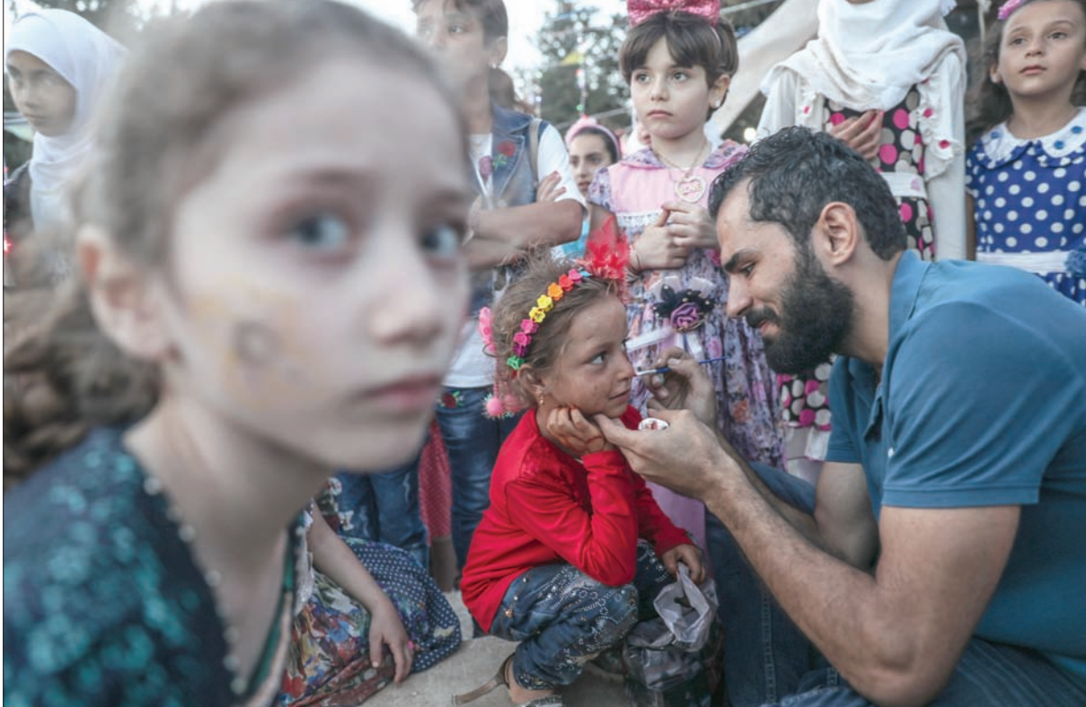
أحد المتطوعين يزين وجوه أطفال بالرسم في إدايب بمناسبة احتفالهم بعيد الفطر

وفي التطورات الميدانية أمس، أقيمت بمقتل شخصين وإصابة آخرين بجراح، جراء استهداف قوات النظام بصاروخ موجه إلى مقبرة في بلدة الطامنة في الريف الشمالي الحموي، فيما تحدث «المركز» عن فتح قوات النظام نيران رشاشاتها الثقيلة على مناطق في درعا البلد بمدينة درعا، ما تسبب في أضرار مادية، وذلك في تجدد لعمليات استهداف المدينة التي نفذها قوات النظام بين الحين والآخر، في خرق لاتفاق الجنوب السوري الذي جرى التوصل إليه باتفاق أميركي - روسي - أردني، في يوليو (تموز) من العام الماضي.