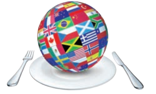
يورك (شمال إنجلترا)، جوسلين إيليا