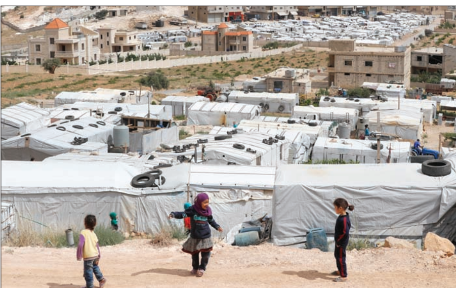
أطفال سوريون يلعبون في أحد المخيمات ببلدة عرسال قرب الحدود اللبنانية - السورية