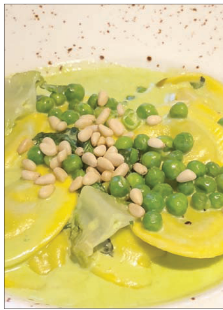
رافيولي مع الصنوبر