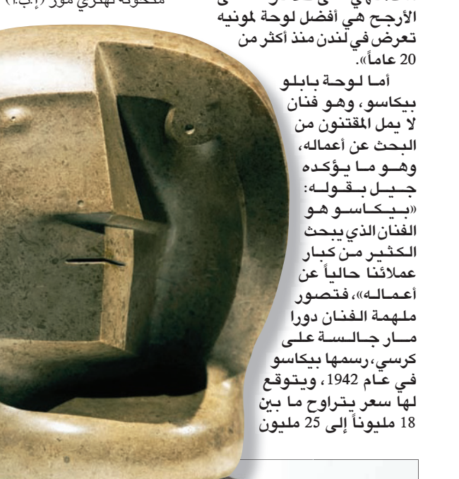
منحوتة لهنري مور (إبأ)

أما لوحة بابلو بيكاسو، وهو فنان لا يمل المقتنون من البحث عن أعماله، وهو ما يؤكد جيل بقوله: «بيكاسو هو الفنان الذي يبحث الكثير من كبار عملائنا حالياً عن أعماله»، فتصور ملهمة الفنان دورا صار جالسة على كرسي، رسمها بيكاسو في عام 1942، ويتوقع لها سعر يتراوح ما بين 18 مليوناً إلى 25 مليون عاماً».