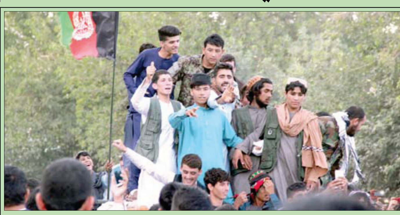
جنود أفغان ومقاتلون من «طالبان» وسط المواطنين خلال احتفالات بعيد الفطر في قندوز بشمال أفغانستان أمس. وفجر انتحاري من «داعش» نفسه لاحقاً في جموع المحتفلين بـ «مصالحة العيد» (إ.ب.أ) (تفاصيل ص 9)