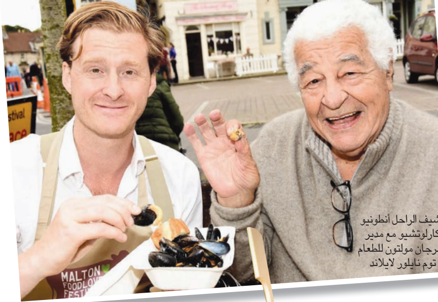
الشيف الراحل أنطونيو كارولتشيو مع مدير مهرجان مولتون للطعام توم نيلور لايلاند

محطة القطار في مولتون قريبة جداً من مكان المهرجان (Talbot Yard Food Court) في (5 دقائق على الأقدام) والرحلة إلى يورك لا تتعدى الثلاثين دقيقة. فإذا كنت من محبي الطعام والتعرف على معالم جميلة في إنجلترا يمكنك أن تمزج الزيارات في زيارة واحدة.