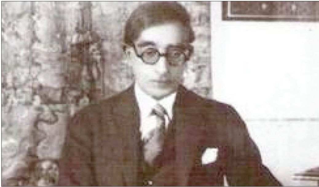
الشاعر اليوناني كفافيس