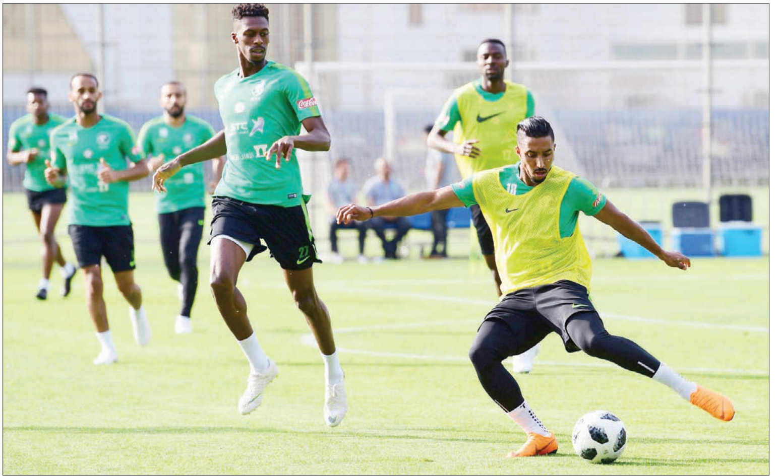
من تدريبات المنتخب السعودي في روسيا أمس (الشرق الأوسط)