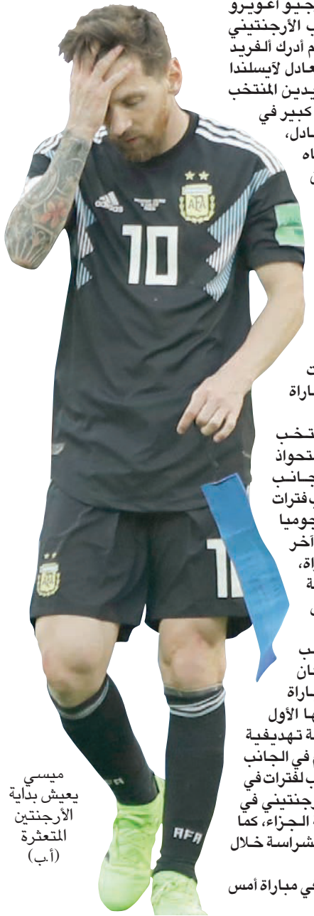
موسكو، «التشرق الأوسط»

ميسي يعييش بداية الأرجنتين المتعثرة