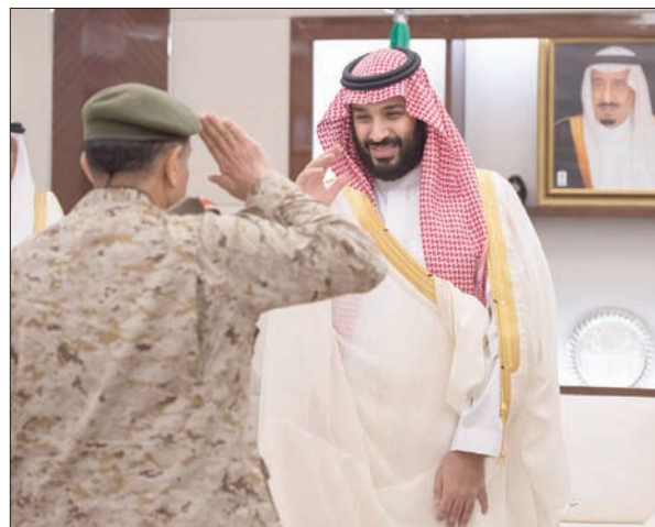
الأمير محمد بن سلمان خلال استقباله قادة أفرع القوات المسلحة وكبار المسؤولين في وزارة الدفاع

ووجه الأمير عبد العزيز بن سعود، قادة القطاعات الأمنية كافة خلال استقباله لهم في مقر وزارة الدفاع بمكة المكرمة، بمناسبة عيد الفطر المبارك، منسوبيهم ضباطاً وأفراداً، مهتماً بالجميع بالمستوى المتميز من الإعداد والأداء الذي أظهروه في إدارة وتنظيم حركة المعتمرين والزوار خلال شهر رمضان المبارك.