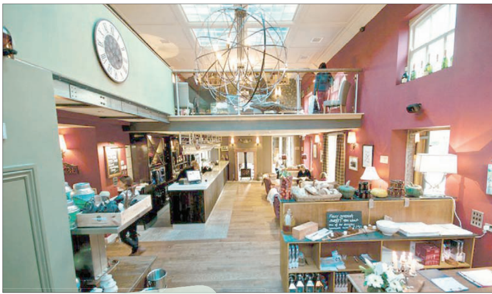
ديكور جميل وأنيق في مطعم «ذا ستار إن ذا سيتي»