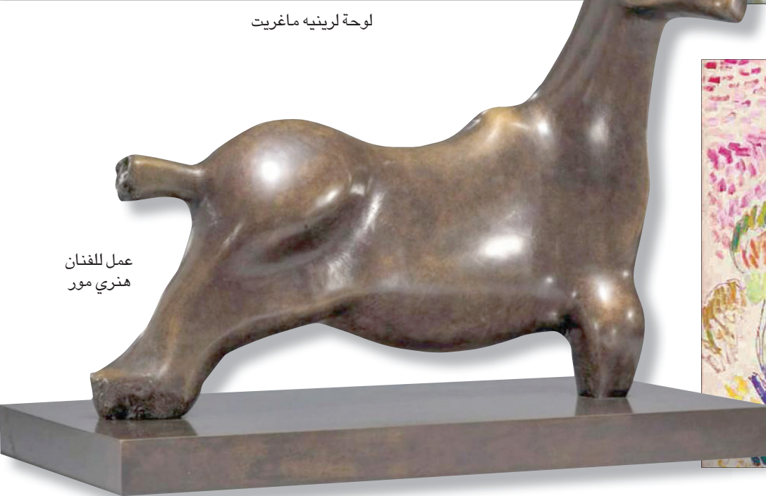
عمل للفنان هنري مور