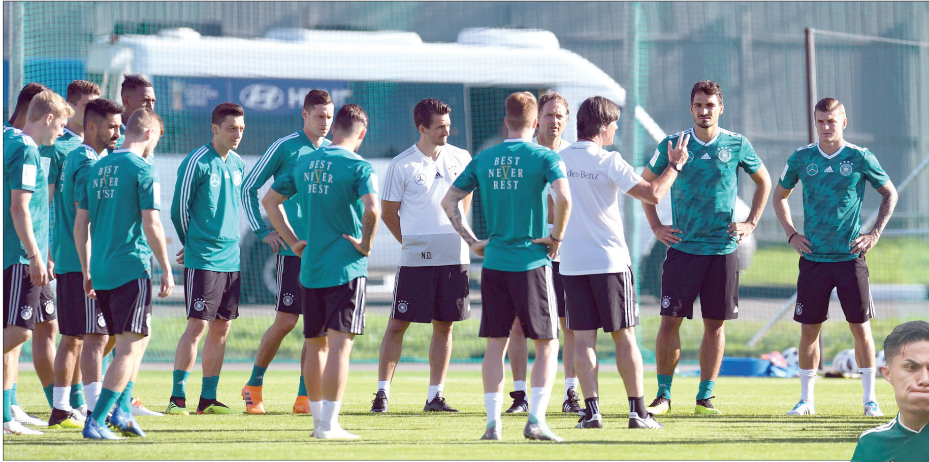
لوف مدرب ألمانيا يلقي تعليماته على لاعبيه قبل خوض الجولة الأولى بالمونديال

«يركض كثيرا. إذا احتاج الأمر، فإنهم سيركضون في مباراة واحدة المسافة التي تركضها في مباراتين». وربما يخشى لوف أن تكون للمباريات التحضيرية تأثير على فريقه اليوم بعدما اكتفى الألمان بفوز واحد في ست مباريات ودية منذ إنشائها التصفيات بعلامة كاملة (10 انتصارات). كما يأمل أن يكون لاعبا الفريق مسعود أوزيل وإلكاي غونودغان في أفضل حال وهما وصلا الأراضي الروسية في ظروف صعبة بسبب الانتقادات الموجهة لهما على خلفية صورتهما المثيرة للجدل مع الرئيس التركي رجب طيب أردوغان الشهر الماضي.