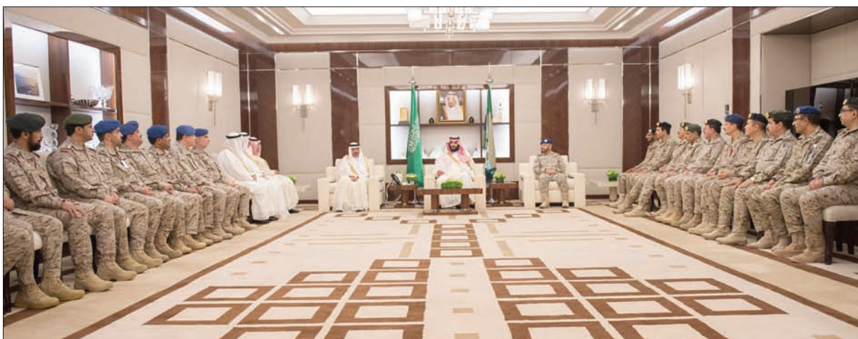
الأمير محمد بن سلمان خلال استقباله قادة أفرع القوات المسلحة وكبار المسؤولين في وزارة الدفاع