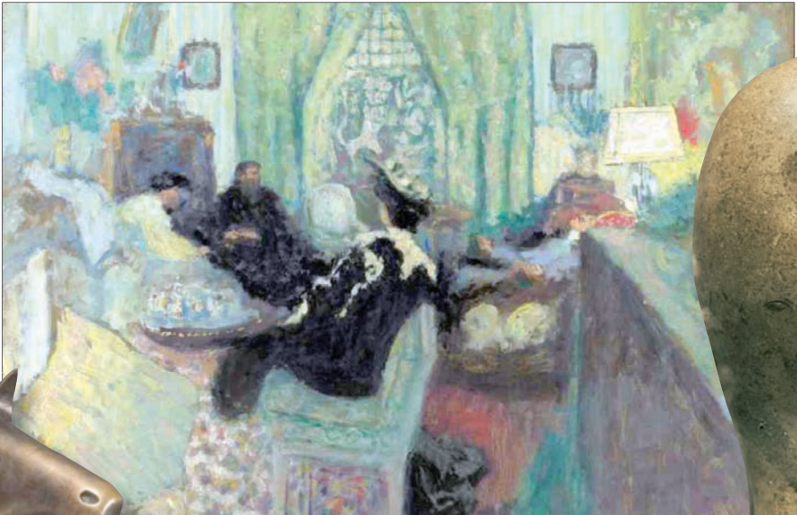
لوحة لإدوار فويلار