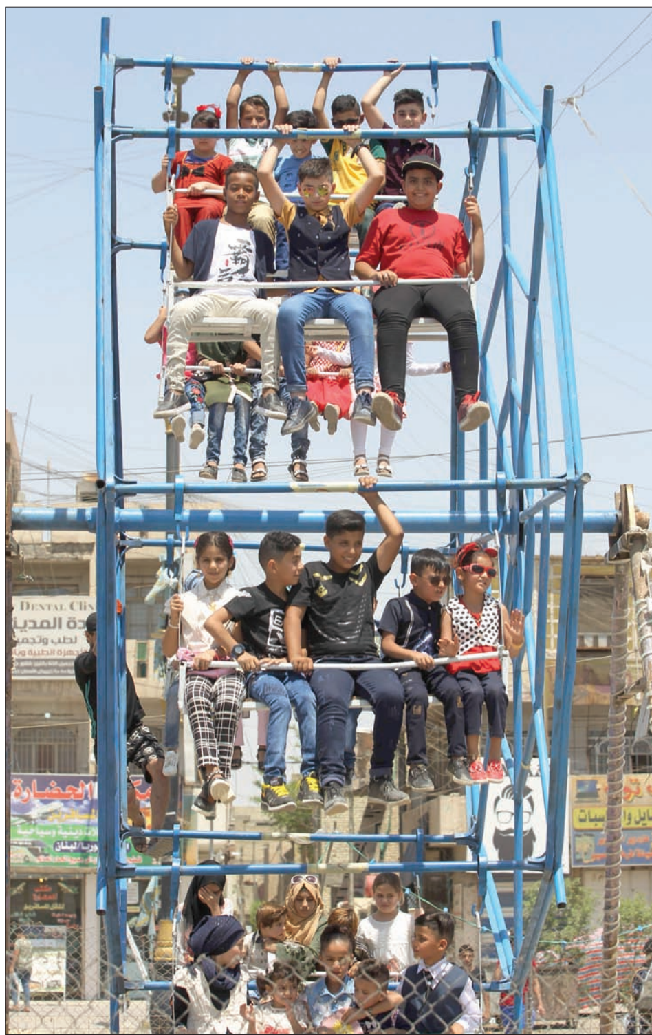
أطفال عراقيون في متزعة بمدينة الصدر في بغداد في ثاني أيام عيد الفطر أمس

في غضون ذلك، قال عماد الحكيم في خطبة صلاة عيد الفطر: «من الخطأ العودة إلى المعادلة القديمة وتوقع الحصول على نتائج أفضل، فالاصطفاف المذهبية والقومية لا تستطيع إنتاج حكومة وطنية تلبى