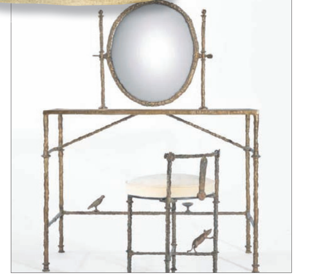
طاولة ومقعد من عمل دييغو جيماكوميتي

أما لوحة بابلو بيكاسو، وهو فنان لا يمل المقتنون من البحث عن أعماله، وهو ما يؤكد جيل بقوله: «بيكاسو هو الفنان الذي يبحث الكثير من كبار عملائنا حالياً عن أعماله»، فتصور ملهمة الفنان دورا صار جالسة على كرسي، رسمها بيكاسو في عام 1942، ويتوقع لها سعر يتراوح ما بين 18 مليوناً إلى 25 مليون عاماً».