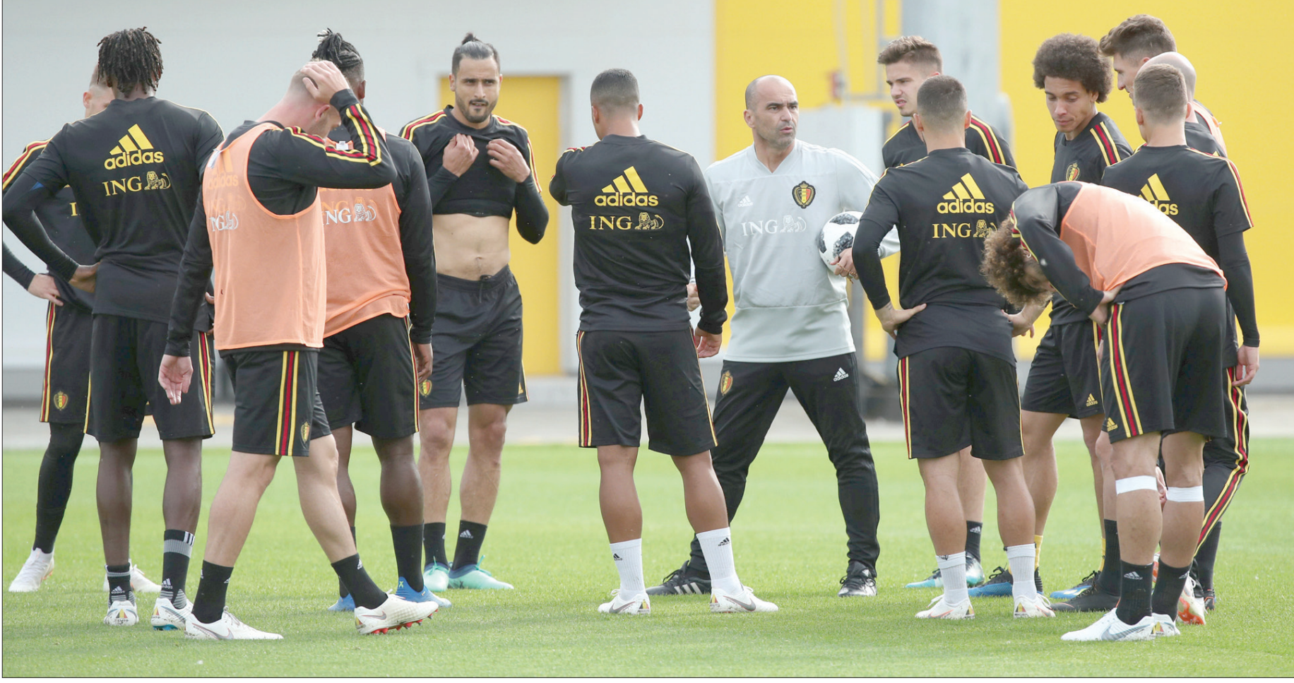
منتخب بلجيكا يستعد لإحداث المفاجأة في روسيا

وقال مارتينيز رداً على ذلك: «نحن لا نلعب عادة بطريقة 3-5-2، لكننا نريد أن ننسجم بالمرور. الطريقة التي نلعبها تعتمد عليها في