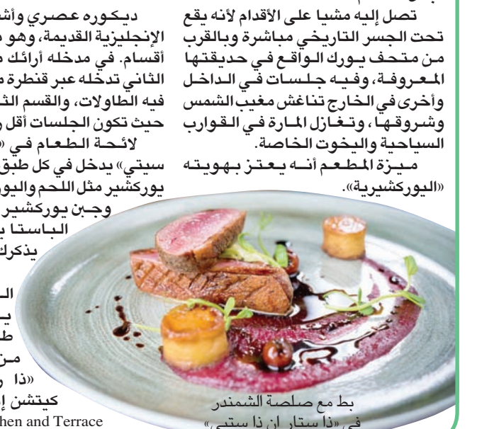
بط مع صلصة الشمندر في «ذا ستار إن ذا سيتي»

ديكوره عصري وأشبه بالحنات الإنجليزية القديمة، وهو مقسم إلى ثلاثة أقسام. في مدخله أرائك مريحة، والقسم الثاني تدخله عبر قنطرة من الحجر توزع فيه الطاولات، والقسم الثالث في الخارج حيث تكون الجلسات أقل رسمية. لائحة الطعام في «ذا ستار إن ذا سيتي» يدخل في كل طبق فيها مكون من يوركشير مثل اللحم واليوركشير بويدينغ، وجبن يوركشير، وحتى أطباق الباستا يدخل فيها ما يذكر بيوركشير. والمطعم الثاني الذي يحمله في طياته الكثير من التاريخ هو «ذا ريفيكيتوري كيتشن إن ذا تراس» Refectory Kitchen and Terrace