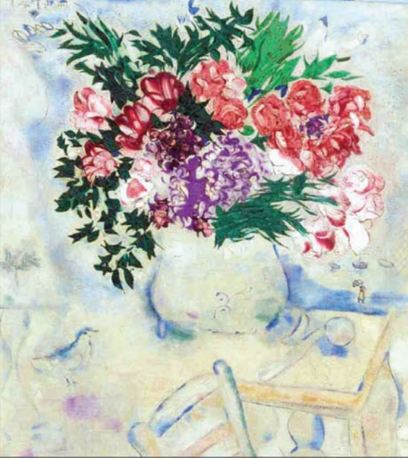
عمل للفنان مارك شاغال