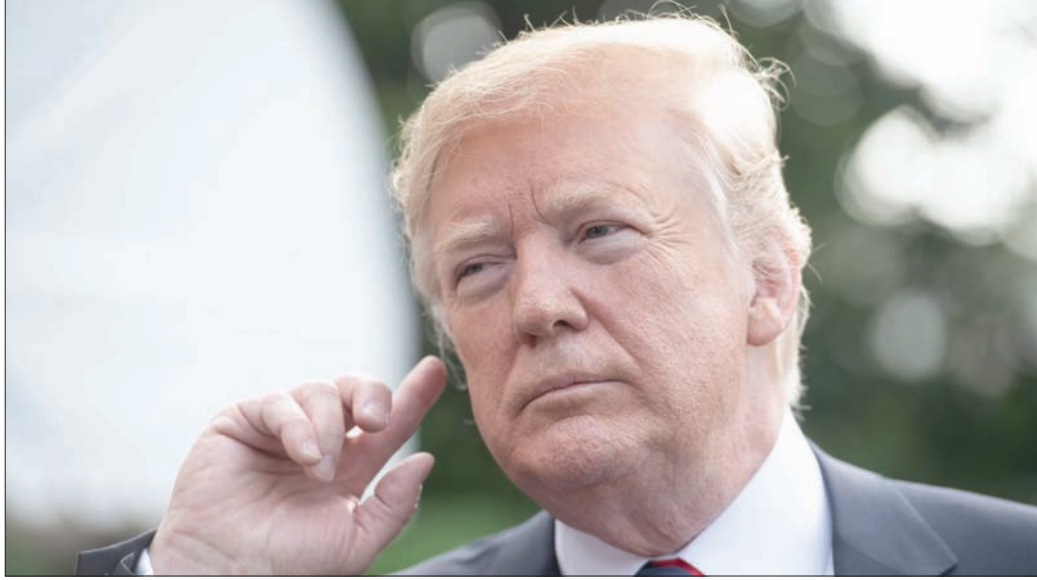
دونالد ترمب في مؤتمر صحافي أمام البيت الأبيض

الرئيس ترمب، إنه ينبغي لكل دولة أن تكون قادرة على أن تقرر بمفردها متى يكون أمنها القومي في خطر وتفرض وفقاً لذلك الرسوم الجمركية وفق إرادتها، وهو التحول الكبير الذي يفتح الباب أمام أي دولة لأن يفرض الحواجز الجمركية في أي وقت تشاء.