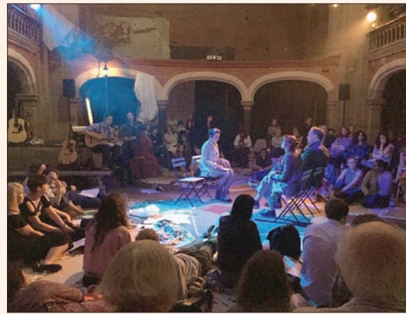
ندن، غالية قباني

عرض «Dawn & Out» المستوحى من يوميات الكاتب البريطاني جورج أورويل (مؤسسة أورويل الخيرية)