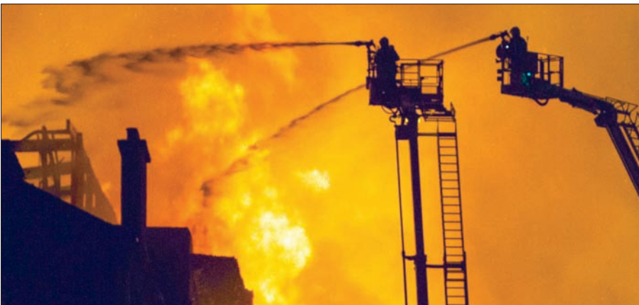
رجال الإطفاء أثناء إخماد الحريق في مدرسة غلاسكو للفنون (إ.ب.أ)

لدينا وخدمات الطوارئ الأخرى. كل ما أفكر فيه الليلة هو سلامة المواطنين - ولكن قلبي محطم أيضاً بسبب حريق مدرسة غلاسكو للفنون المحبوبة. وقال بول سويدي، النائب البرلماني لحزب «العمال» عن دائرة «غلاسكو نورث إيست» في تغريدة له مساء أمس الجمعة إن الحريق كان في أكثر المباني أهمية من الناحية المعمارية في غلاسكو، وكتب: «لا يمكن أن نفقد هذا المبنى». وأضاف أيضاً أنه سيستخدم منصبه في البرلمان، لدعم إجراء تحقيق شامل بشأن الحادث.