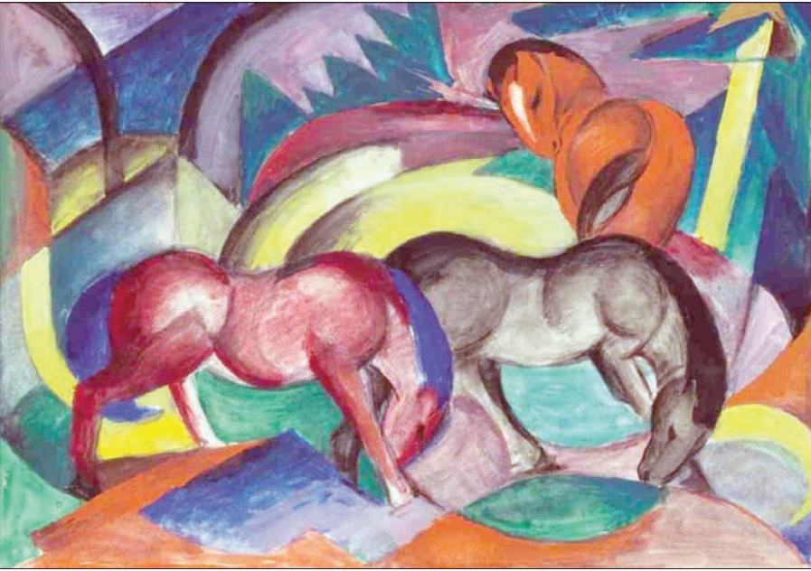
لوحة الفنان فرانز مارك