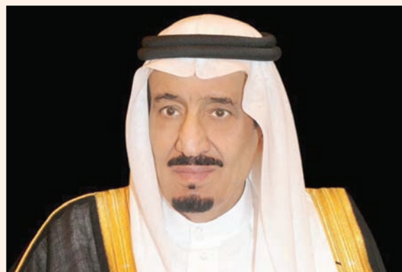
جدة، «الشرق الأوسط»

الشريفين عن شكره للرئيس السيسي والشخص محمد بن زايد على التهنئة بهذه المناسبة المباركة، «سألا الله تعالى أن يعيدها على الأمتين الإسلامية والعربية بالخير والبركات». وكان الملك سلمان تلقى اتصالات هاتفية وبرقيات تهنئة من زعماء وقادة ومسؤولي الدول الخليجية والعربية والإسلامية بهذه المناسبة الإسلامية السعيدة خلال اليومين الماضيين.