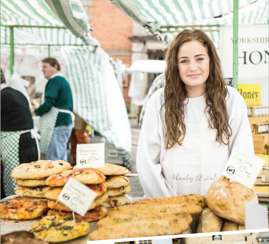
من مهرجان مولتون للطعام

نوع حلوى فرنسية «ماكرون»، ويلبورن بايكري Bakery الشهير بخبزه، وغروفي مو جيلاتو Moo Gelato الذي يتعين عليك الانتظار في طابور طويل لتذوق الأيس كريم فيه، وليوني Leoni الذي يقدم القهوة والشاي الإنجليزي في أجواء تقليدية رائعة... لائحة المعارضين طويلة جداً، فهناك عدد كبير من الأتكاك التي تعرض المأكولات في الهواء الطلق إضافة إلى المطاعم التي تفتح أبوابها على مدى أيام العام.