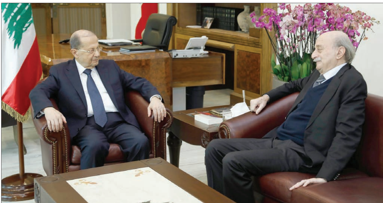
عون وجنبلاط في لقاء سابق في بيروت

بلغت العلاقة بين الرئيس اللبناني ميشال عون ورئيس الحزب التقدمي الاشتراكي وليد جنبلاط، مرحلة غير مسبوقة من التوتر والسجال عالي النبرة، إثر الهجوم الذي شنه الأخير على عون، واعتبر فيه أن «العهد» فاشل من اللحظة الأولى». وتوجي المواقف الحادة للطرفين التي تلت تغريدة جنبلاط النارية، بصعوبة ترميم التصديعات الكبيرة التي أصابت علاقتهما، وتطرح أسئلة عن مدى تأثيرها على مسار تشكيل الحكومة، بعد الإجابات التي طبعت الأيام الأخيرة من المشاورات. ولم تهبط عاصفة الردود العونية على الزعيم الدرزي، والردود المضادة لنواب وكوادر الحزب الاشتراكي، إذ اعتبر النائب الراحل عون عضو كتلة «لبنان القوي»، أن هذا «الموقف المفاجئ» هو نتيجة طبيعية لتقلبات جنبلاط المعتادة وغير المفهومة، وهل هو مرتبط بمسألة تشكيل الحكومة أو بزيارته الأخيرة للمملكة العربية السعودية، وتسليف موقفه لطرف خارجي». وراى تصريح لـ«التشرق الأوسط»، أن موقف جنبلاط «يناقض ما قاله بعد لقاء رئيس الجمهورية خلال الاستشارات النيابية، ويشكل انقلاباً واضحاً يعكس حقيقة ما يجري في باطنه وخلفيته»، معتبراً أنه «ههما احترم الخلاف بين (الحزب الاشتراكي) و(التيار الوطني الحر) لا يبرر هذا الاعتداء على رئيس الجمهورية وهدم العلاقة». وتتمزق علاقة عون - جنبلاط بتقلبات دائمة، وهي ترجمت بتحفظ الزعيم الدرزي على انتخاب عون رئيساً للجمهورية، نظراً لخلافهما الجذري حول الخيارات السياسية ومعالجة الملفات الداخلية، حيث أوضح مفوض الإعلام في الحزب الاشتراكي رامي الرئيس لـ«التشرق الأوسط»، أن موقف جنبلاط «ليس مفاجئاً للمراقبين، إذ سبق ووجه انتقادات لـ(العهد) ورفيقه السياسي». وراى أن «تجاوزات هذا