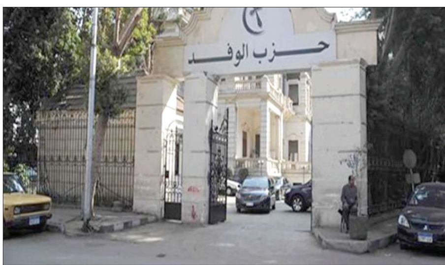
مقر حزب «الوفد» في حي الدقي (الشرق الأوسط)

السياريو الأقرب للإعلان عن ائتلاف المعارضة من خلال «الوفد»، حيث يقود بهاء أبو شقة، وهو رئيس لجنة الشؤون الدستورية والتشريعية بمجلس النواب (البرلمان)، مشاورات واسعة مع عدد من الأحزاب والقوى السياسية وكذلك النواب المستقلين في البرلمان لتشكيل ائتلاف واسع يمثل المعارضة المنزعة تحت القبّة. وأضافت المصادر الوفدية نفسها، أن انضمام حزب المحافظين بات محسوماً؛ إلا أن المشاورات مع حزب «المصريين الأحرار» لم تنسم بعد، مؤكداً أن المشاورات والجلسات مع عدد من الأحزاب والقوى السياسية مستمرة؛ إلا أنه لن يتم الإعلان عن تفاصيلها إلا في الوقت المناسب.