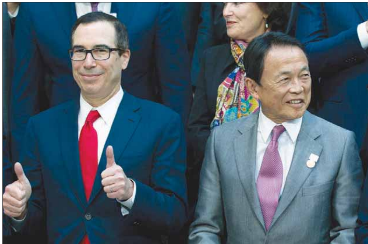
وزير المالية الياباني تارو آسو ووزير الخزانة الأمريكي ستيفن منوتشين خلال «اجتماعات الربيع» أول من أمس

وصرح جيم يونغ كيم رئيس البنك للصحافيين خلال اجتماعات الربيع لصندوق النقد والبنك الدوليين في واشنطن «رغمنا طاقة البنك الدولي لأكثر من المثلث... إنه اقتراح ضخم بالثقة لكن التوقعات هائلة».