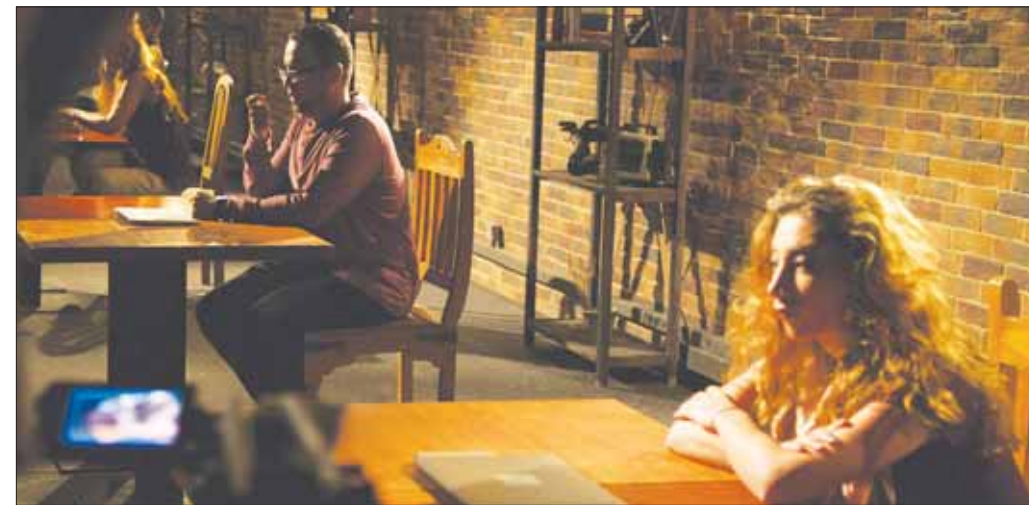
جانب من تصوير برنامج «أنا مصور ناشيونال جيوجرافيك» («الشرق الأوسط»)