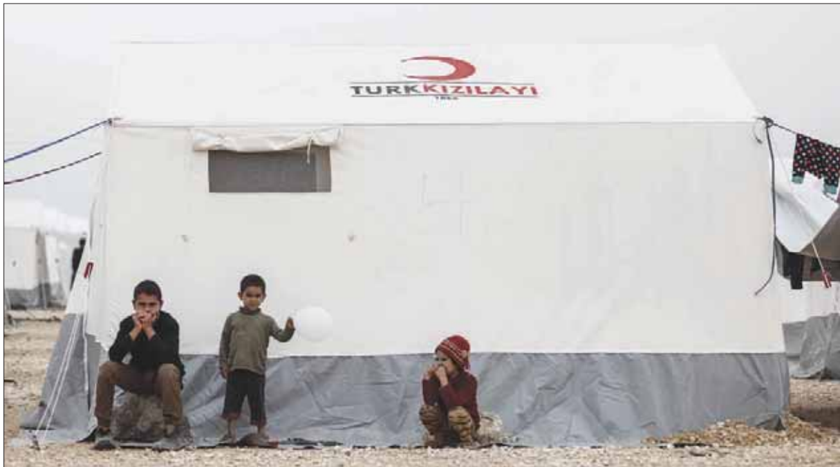
أطفال عائلات نازحة في مخيم محيط أعزاز قرب الحدود السورية - التركية أمس

قلقين للغاية حيال تفاقم النزاع في المنطقة»، لافتاً إلى أنه «بمجرد أن جلس زميلي الروسي فاسيلي (نيبينزيا) والسفيرة الأمريكية نيكي (هيلي) حول طاولة واحدة طيلة يوم ونصف يوم (...) نشأت ثقة يحتاج إليها مجلس الأمن لتحمل مسؤولياته».