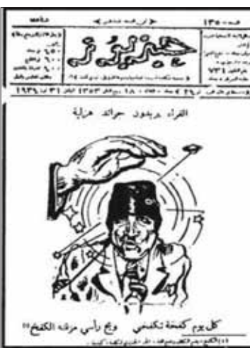
العراقية «حزبوز» التي صدرت في ثلاثينات القرن الماضي