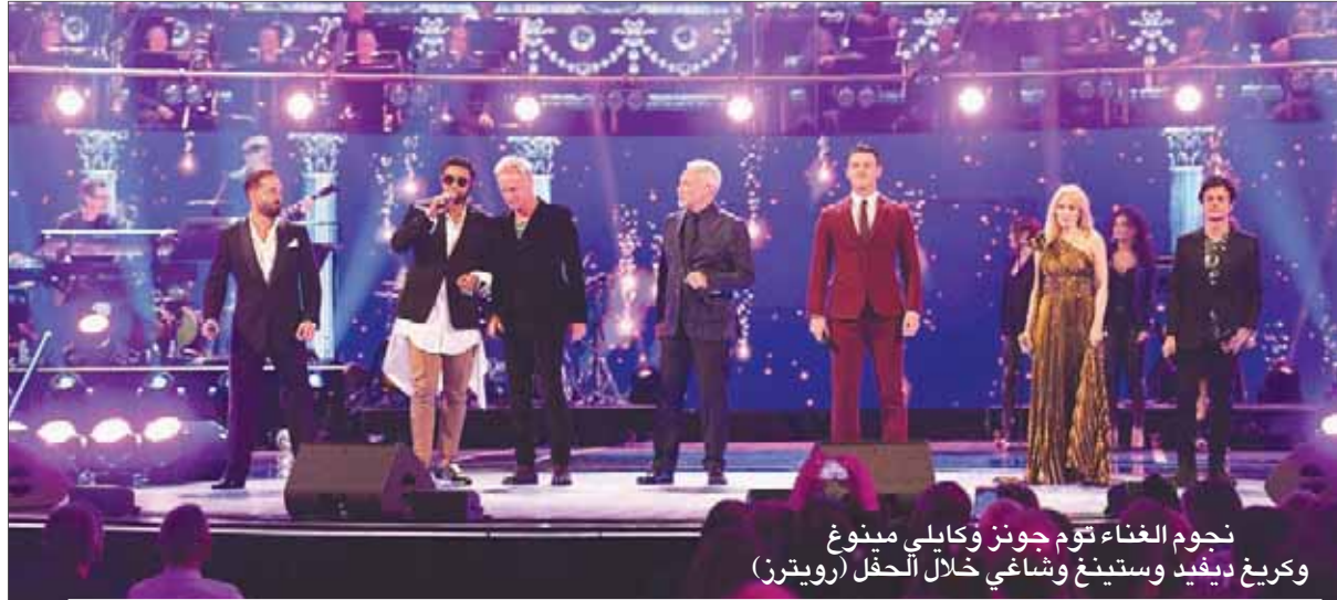
نجوم الغناء توم جونز وكابلي مينوغ وكريغ ديفيد وستينغ وشاغي خلال الحفل