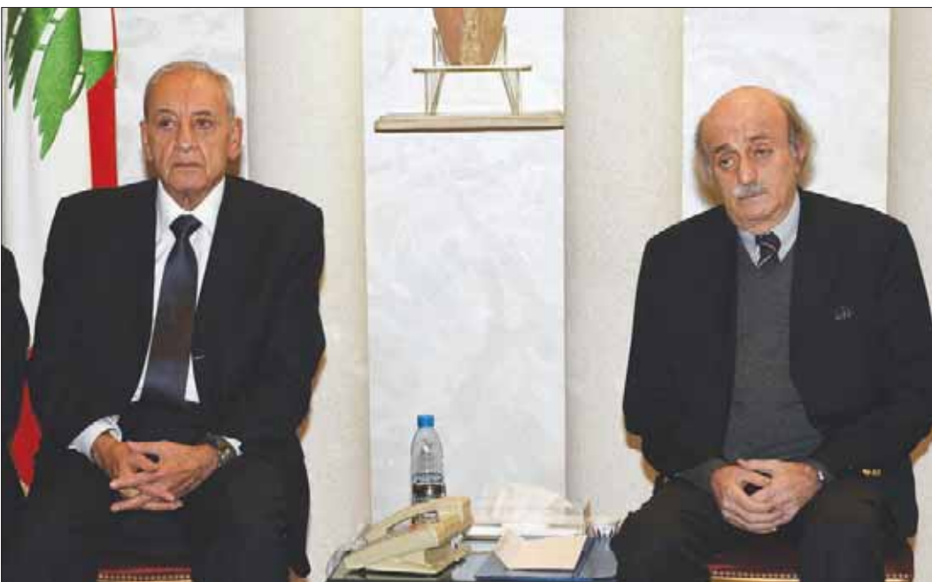
جنبلاط وبري في لقاء يعود إلى عام 2015

رغم كل التحولات السياسية التي شهدها لبنان في السنوات الماضية، ورغم تفكك معظم التحالفات مؤخراً تبعاً لمصالح انتخابية، ظل الحلف السياسي الذي يجمع رئيس المجلس النيابي نبيه بري ورئيس الحزب التقدمي الاشتراكي» النائب وليد جنبلاط صامداً ومتماسكاً، مع ترجيح تشكيلهما بعد الاستحقاق النيابي تكتلاً نيابياً واحداً لم تتبلور حتى الساعة معاملة كما الفرقاء الآخرين الذين قد ينضمون إليه.