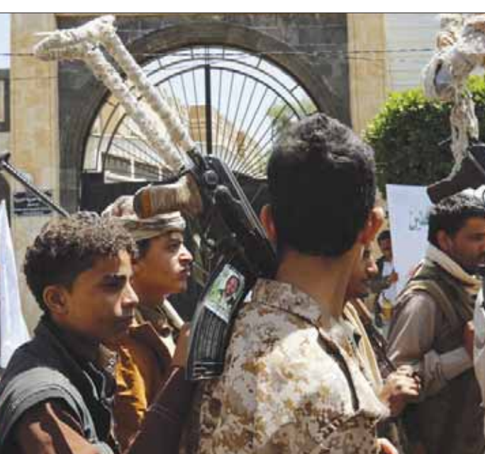
مسلحون حوثيون في تجمع بصنعاء

قوات الجيش اليمني وضربات التحالف، ويتضمن الرقم المعلن الجرحى الذين استقبلتهم المؤسسة الحوثية فقط، في حين يقدر مراقبون أن الرقم الحقيقي لجرحى الجماعة الذين استقبلتهم المستشفيات الخاضعة لها في مناطق سيطرتها يتجاوز ضعف الرقم المعلن. وأدت هذه الخسائر خلال أسبوع في صفوف القيادة الميدانيين للجماعة الحوثية إلى إحجام القادة البارزين عن الظهور الاستعراضى المعتاد خشية الاستهداف من قبل طيران التحالف، في الوقت الذي تحاول فيه أن تدفع بعناصرها من المجندين الجدد إلى جبهات الساحل الغربي، إثر التطورات التي تشهدها هذه الجبهة مع دخول القوات التي يقودها نجل شقيق الرئيس السابق، طارق الجوف الحدودية. وذكر الموقع