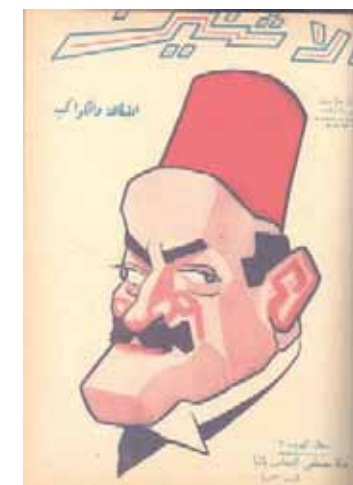
دمجت مجلة «الكواكب» في عام 1934 مع مجلة «الفكاهة» وسُميت المطبوعة الجديدة «الاثنين»

ويشير إلى أن «الموهوبين من الشباب أيضاً وجدوا متنفساً لديهم من مدونات وصفحات ومواقع عبر فضاء الإنترنت، وأيضاً برامج بث على الإنترنت يعبرون فيها عن آرائهم وانتقاداتهم للواقع من حولهم في اللحظة نفسها التي يقع فيها الحدث أحياناً».