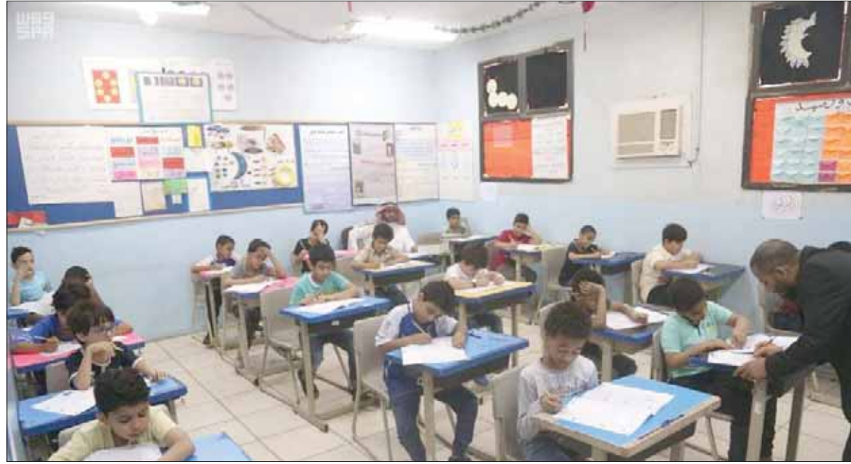
طلاب في إحدى مدارس الرياض

منذ البدايات عبر آليات السلطة الرمزية كبدليل لحالة تكوين الأحزاب السياسية المباشرة، الذي ظل غير متاح لعدد كبير من التخطيمات الشمولية وعلى رأسها جماعة الإخوان المسلمين وبقية أذرع الإسلام السياسي، بحسب بيير بورديو ففترة الدراسة الجامعية. ولقد أظهر سلمان العودة في تلك الحقبة، إلى جانب عدد من المنتهين لما سمي بـ«الصحوة الإسلامية»، عداءً لفكر عدد من المثقفين في المجتمع السعودي.