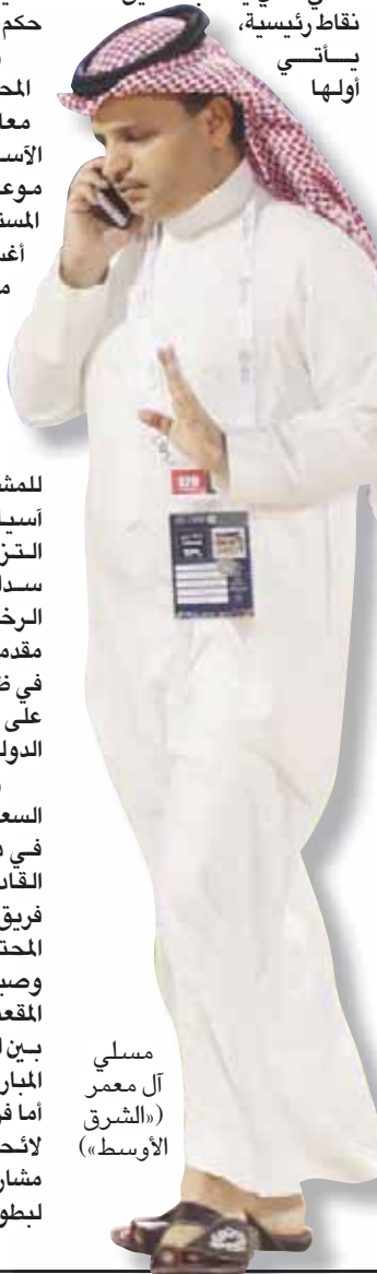
مسلي آل معمر («الشرق الأوسط»)

يجدر بالذكر، أن هناك الكثير من الأندية المؤهلة للمشاركة في بطولة دوري أبطال آسيا في النسخة القادمة لديها التزامات مالية كبيرة يتطلب سدادها قبل الحصول على الرخصة الآسيوية، يأتي على مقدمتها ناديا النصر والاتحاد، في ظل وجود الكثير من القضايا على الفريقين في اتحاد كرة القدم الدولي (فيفا). وبحسب توزيع الاتحاد السعودي لكرة القدم للفريق المشاركة في دوري أبطال آسيا القادم، ستشهد البطولة مشاركة فريق الهلال بصفته بطلاً لدوري المحترفين السعودي، إضافة إلى وصيفة الأهلي، في حين سيكون المقعد الثالث للمشاركة المباشرة بين الفيصلي والاتحاد طرفي المباراة النهائية لبطولة كأس الملك، أما فريق النصر الذي حل ثالثاً في لأندية ترتيب الدوري فستكون مشاركة عن طريق الملحق المؤهل لبطولة دوري أبطال آسيا.