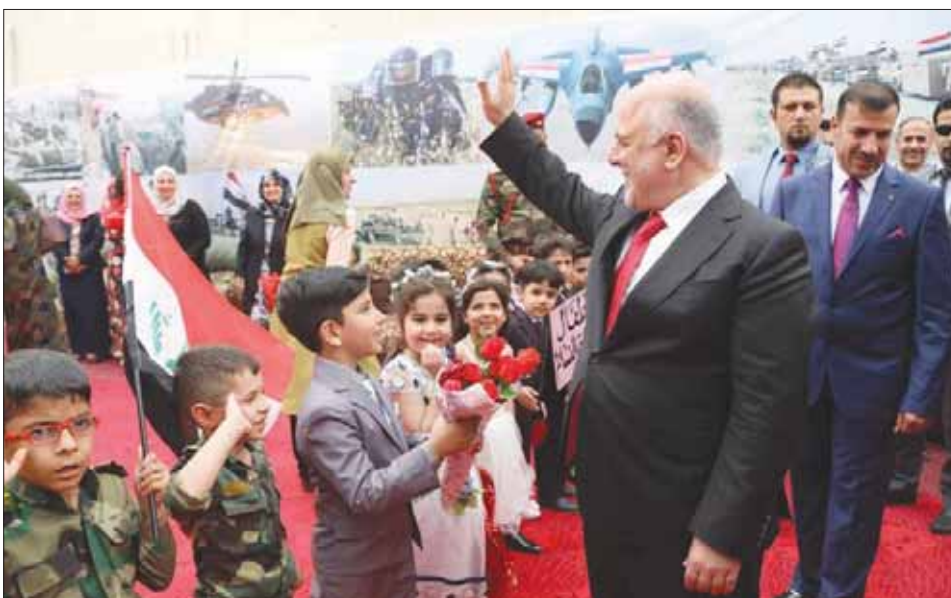
صورة من موقع رئاسة الوزراء العراقية للعبادي خلال زيارته أمس لعامة الفلوجة بمحافظة الأنبار

تتكرر في المحافظات الأخرى حتى لا تحسب شخصيات هذه المحافظة على تلك الشخصيات، في إشارة إلى المصطلحات التي يتم تداولها في الأوساط السنية حبال الشخصيات التي عملت مع رئيس الوزراء السابق نوري المالكي، وأطلق عليها «سنة العبادي»، وأوضح الهايس: «في الواقع ليس العبادي وحده من طرح قائمة في الأنبار ينزعها شيعي، ومعظم المختمين لها من الشيعة، بل (الفتح) التي تحمل الحشد (الشيعي) لديها قائمة في الأنبار، ويترأسها سني من أبناء المحافظة».