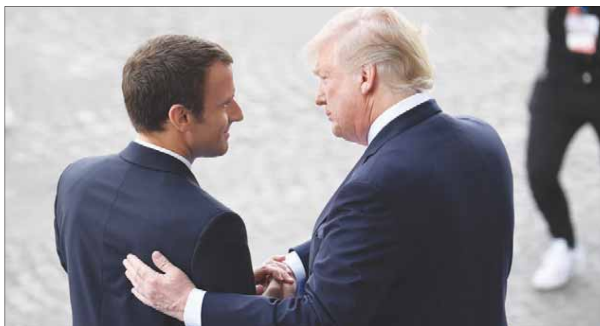
الرئيس الفرنسي يودع نظيره الأميركي في باريس العام الماضي

بقيادة الرئيس حسن روحاني، وحلف «المحافظين» و«الحرس الثوري»، ومصير الاتفاق يتخذ ذريعة لتصفية حسابات سياسية. وكل ذلك يدور على خلفية أزمة اقتصادية اجتماعية، وتهاوي سعر العملة الوطنية. ويجد فريق روحاني نفسه مضطراً لـ«المزايدة»، سعياً لقطع الطريق على المحافظين، فيما تستهدفه الانتقادات الحامية، لأن وعود الجبوح الاقتصادية مع رفع العقوبات المفروضة على إيران لم تتحقق.