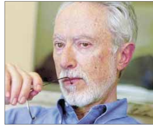
جي إم كويتزي

وقد تزامن صدور الكتاب مع احتفال أقيم في مكتبة جامعة لندن يومي 5-6 أكتوبر (تشرين الأول) 2017 تكريماً لكويتزي، حيث قرأ مختارات من أعماله تلتها معزوفة لباح قدمتها عازقة البيانو كاترين موزلي، وعازف التشيللو جوزيف سيونر. والكتاب الثالث من تأليف مارتين أميس عنوانه «عائق الزمن: بيلو ونابوكوف وحتشنز وترافولتا وترمب: مقالات وتحقيقات صحافية: 1994 - 2016» (الناشر: كيب، 368 صفحة) Martin Amis, The Rub of Time: Bellow, Nabokov, Hitchens, Travolta, 1994 Trump: Essays and Reportage