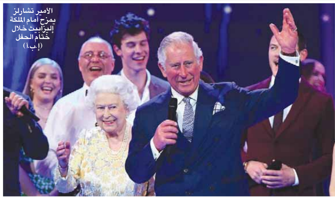
الأمير تشارلز يمزح أمام الملكة إليزابيث خلال ختام الحفل