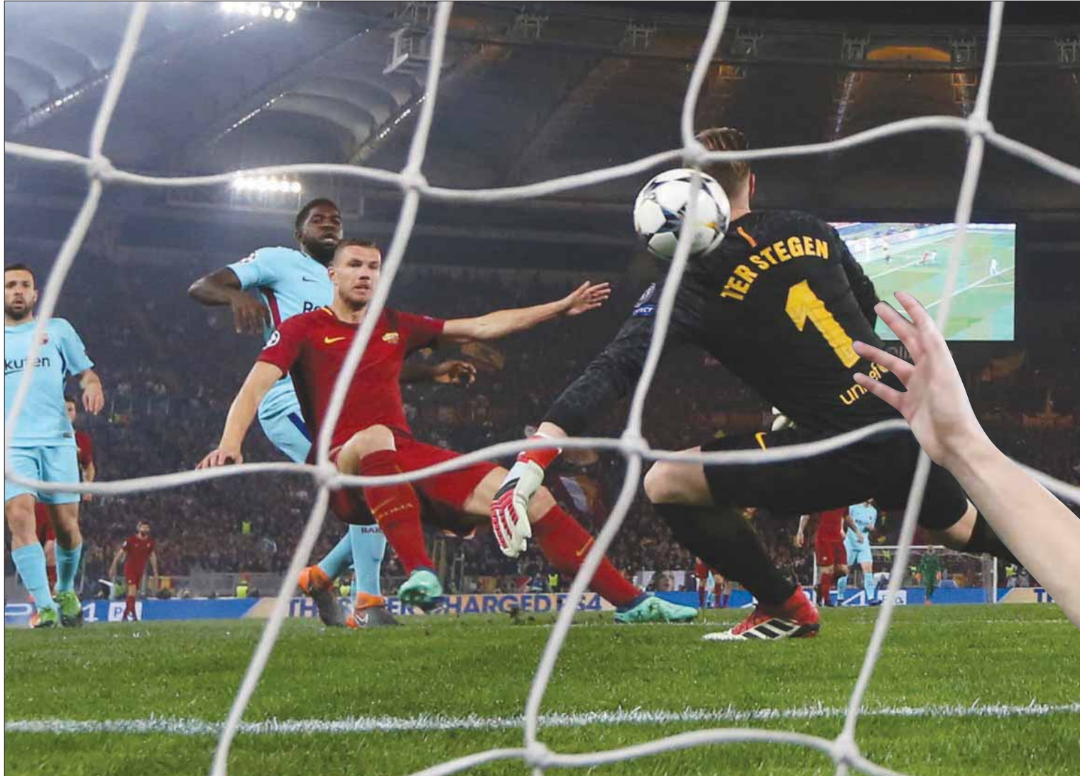
دزيكو يسجل في مرمى برشلونة ليمنح روما التأهل لنصف نهائي دوري الأبطال

على السبب وراء سماح مانشستر سيتي برحيله، فإن حقيقة تسجيله 3 أهداف فقط على مدار 4 مواسم في بطولة دوري أبطال أوروبا ربما تشكل نقطة بداية جيدة. وبحلول وقت انضمامه إلى روما، بدأ أن سحره تالشي. وبالفعل، بدأ أنه يواجه صعوبات شديدة خلال عامه الأول في الدوري الإيطالي. وخلال موسمه الثاني هناك، تمكن من إحراز 39 هدفاً في جميع المسابقات، ثم سرعان ما ارتقى بأدائه هذا العام إلى مستوى مهتر تجلى بشكل خاص في صولاته وجولاته في دوري أبطال أوروبا. وقد سجل هدفاً متميزاً خلال المواجهة أمام تشيلسي والتي انتهت بالتعادل 3 - 3 على أرض ملعب ستامفورد بريدج في أكتوبر (تشرين الأول) خلال مباريات دور المجموعات، علاوة على تسجيله هدفاً حاسماً في شبكات ساختار دونتيسك، ونجح في بث الحياة في فريقه في وقت قاتل منذ أسبوعين فقط داخل استاد كامب نو.