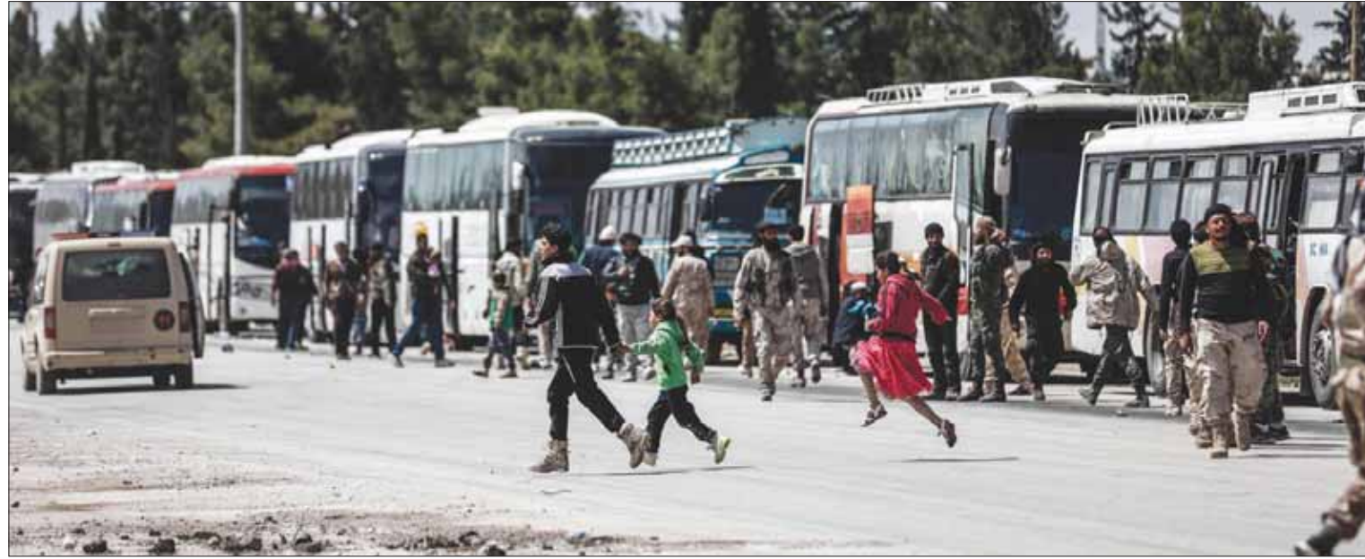
مهجرون يغادرون حافلات أقلتهم من القلمون الشرقي لحظة وصولهم إلى نقطة تفتيش في بلدة الباب شمال سوريا أمس

الشمالية لمخيم اليرموك بين قوات النظام و«هيئة تحرير الشام». في سياق آخر، بدأ مقاتلو المعارضة أمس الأحد، الانسحاب من جيب كانوا يسيطرون عليه بقع شمال شرقي دمشق في منطقة القلمون الشرقي بموجب اتفاق استسلام مع النظام. ويجري نقلهم لمنطقة تسيطر عليها المعارضة على الحدود مع تركيا. وأشار «المركز السوري لحقوق الإنسان» إلى أن قافلة المهجرين من القلمون الشرقي التي تضم نحو 44 حافلة، وصلت إلى تخوم منطقة جنديريس التي جرى نقلهم إليها، بعد دخولهم إلى مناطق سيطرة قوات عملية «درع الفرات»، حيث جرى نقلهم بعد اختيار عفرين كوجهة للمهجرين من القلمون الشرقي، في حين جاءت العملية بعد نقل المئات من منطقة الضمير الواقعة في القلمون الشرقي إلى منطقة جنديريس الواقعة في ريف عفرين الجنوبي الغربي.