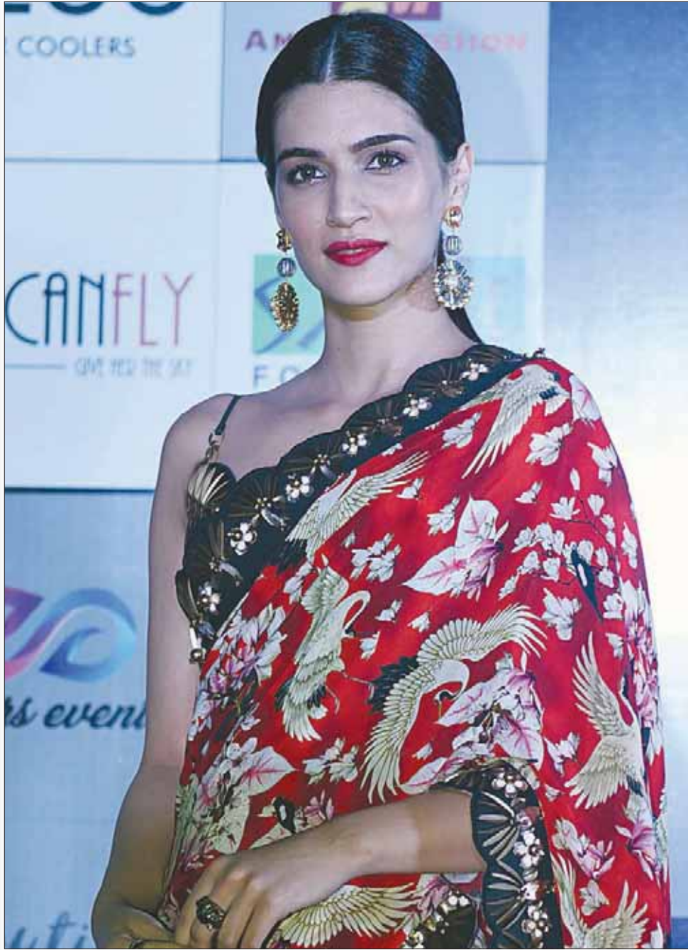
الممثلة الهندية كريتي سانون خلال حدث ترويجي في مومباي