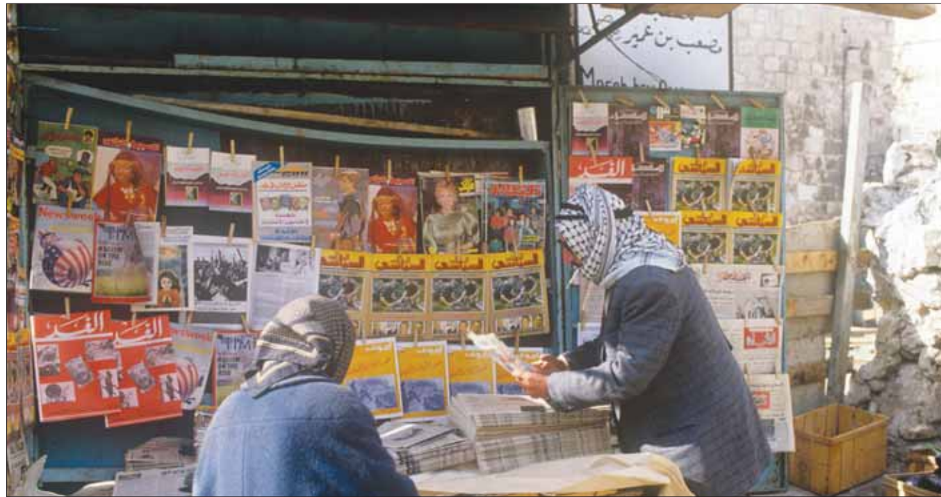
كشك للصحف والمجلات في القدس القديمة عام 1984 لم تبغ عنه المطبوعات الفكاهية