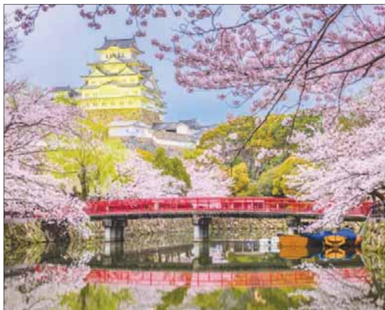
طوكيو - تتدّن: «الشرق الأوسط»

يستمتع زوار متخزه في مدينة هيروساكي بمقاطعة أوموري شمالي اليابان بالمشهد الخلاب الذي تشكله زهور 2600 شجرة كرز. ويشهد هذا العام النسخة المائة من مهرجان أزهار الكرز، في المنزه المحيط بقلعة هيروساكي، حسب ما ذكرته هيئة الإذاعة اليابانية، أمس. وكجزء من الاحتفالات، أدى فريق العروض الجوية «بلو إمبالس» في قوة الدفاع الذاتي اليابانية عرضاً جويًا لإمتاع الحشود المختلفة بالمهرجان.