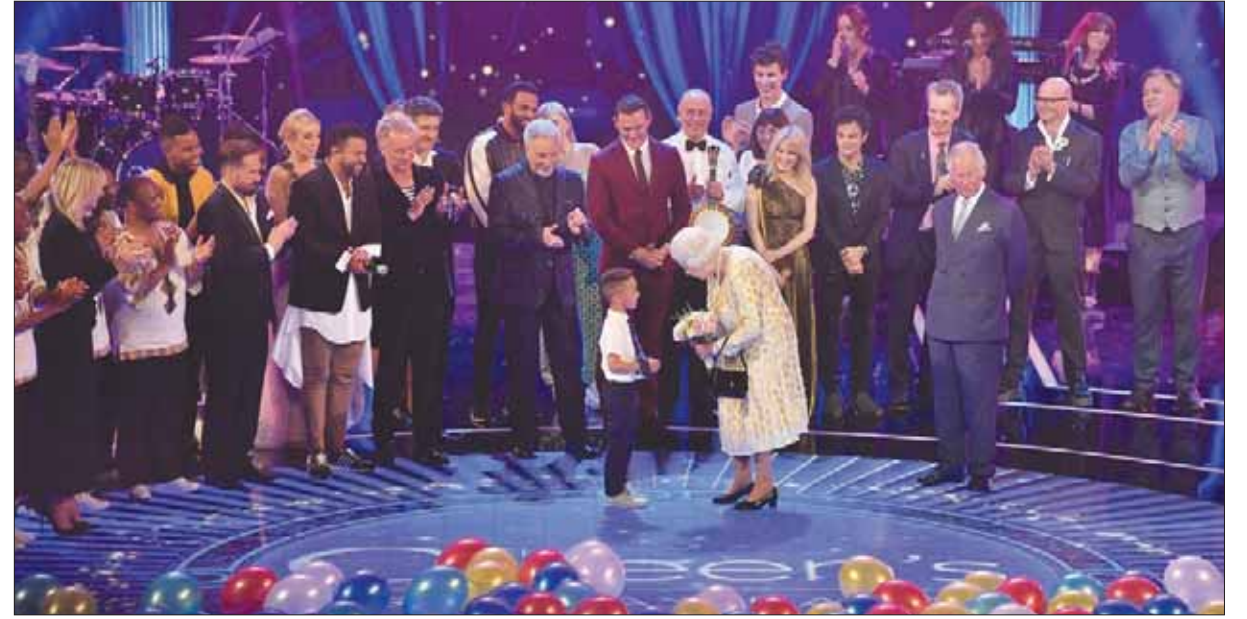
طفل يقدم زهورا للملكة في حفل عيد ميلادها