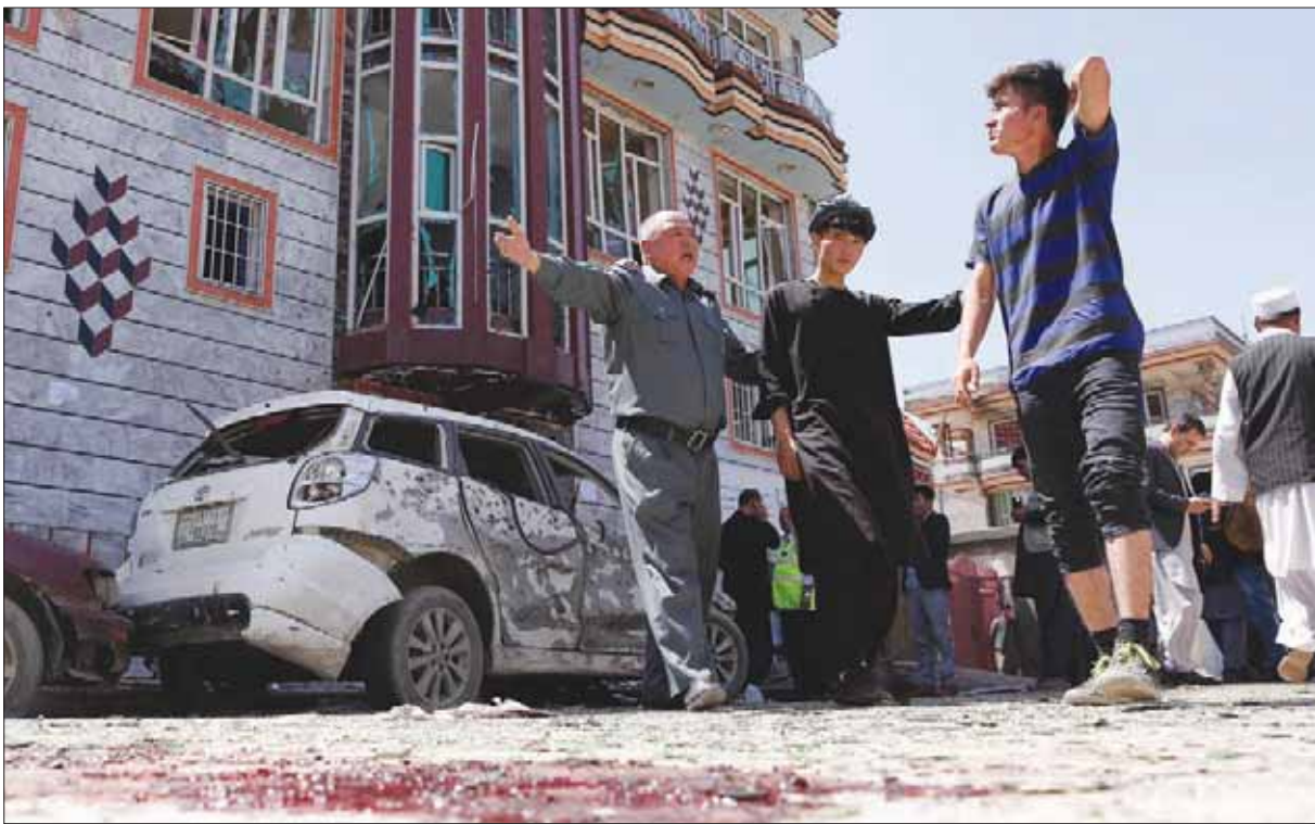
استنفار أممي في موقع التفجير الانتحاري ضد مركز انتخابي في كابل أمس