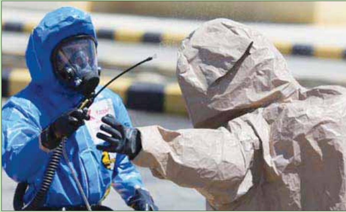
تمرين على معالجة ضحايا الهجمات الكيميائية خلال مناورات «الأسد المتأهب» الأميركية - الأردنية في الزرقاء أمس