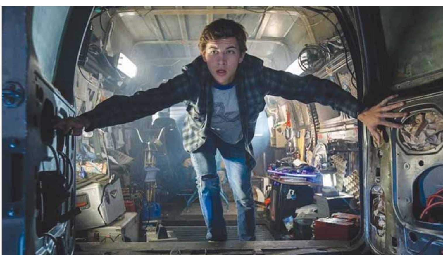
من فيلم سبيلبرغ الجديد Ready Player One

يدركان أن مركبة فضائية ستحط قريبه. هذه الخيمة مستوحاة مما عصف به أحداث سبيلبرغ العائلية ذاتها، لكن