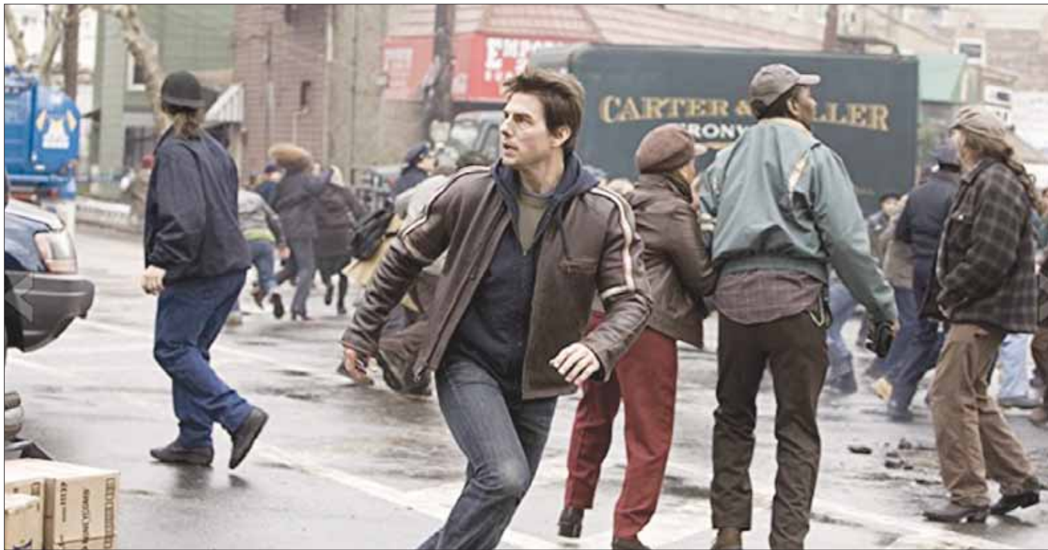
تحت الهجوم في «حرب عالمين»

«ذكاء اصطناعي»، و«تقرير الأقلية» - مختلفان. الأول عن سيناريو اشتغل عليه ستانلي كوبريك ففيلم قادم لم ينجزه عن صبي مصنوع علمياً يبحث مستقبل عن عاطفة إنسانية تحتويه، والثاني عن تجسس السلطات على الأفراد العاديين، ما بذكرنا بواقع المؤسسات الإلكترونية الحالية.