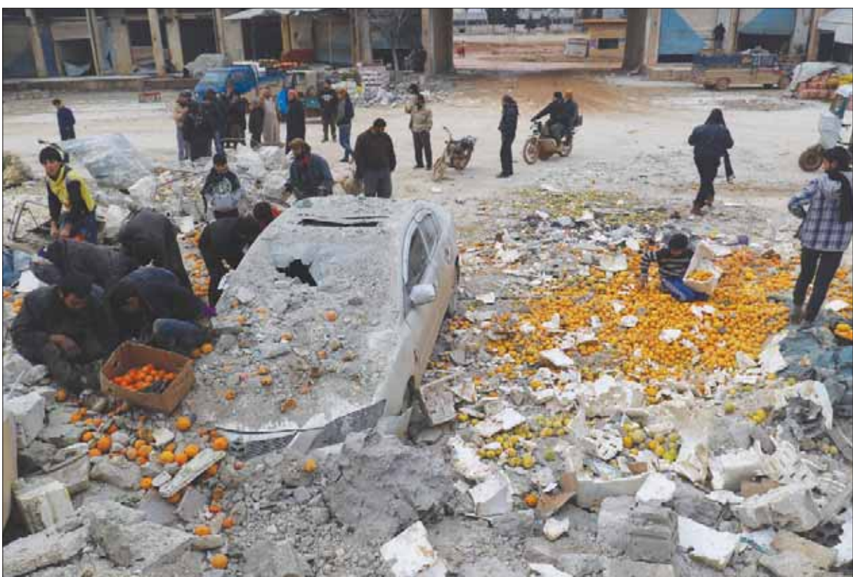
استهداف سوق في معرة مصرين بمحافظة إدلب بغارات الطيران الحربي العام الماضي

الإسلامي، الجنرال محسن رضائي. وذكر التقرير أن «ثمة مؤشرات توحي بحدوث تفكك داخل سوريا»، مضيفاً أن ما يهم روسيا والولايات المتحدة «تنسيق تحركاتهما»، والحيلولة دون وقوع «صدامات عنيفة بين مصالح متعارضة». من ناحيته، طرح الجنرال مارتن ديمبسي، رئيس العمل الأميركية المشتركة في عهد الرئيس باراك أوباما، تحليلاً مشابهاً، عندما لمح إلى «الاحتمالات والتداعيات»، وأشار إلى أنه على سبيل المثال ثمة احتمالية مرتفعة لوقوع هجوم إرهابي ضد الولايات المتحدة أو أحد حلفائها الغربيين، لكن تداعيات ذلك تبقى في مستوى يمكن إدارته والتعامل معه.