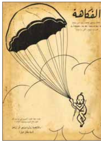
«الفكاهة» أصدرتها دار الهلال في ديسمبر عام 1926

خلال مجلة «التكيت والتكيت» وكان مسانداً للفكرة العرابية واهتمت بموضوعات وقضايا التعليم والامية وصيغة فكاهية انتقد لعب القمار وشرب الخمر».