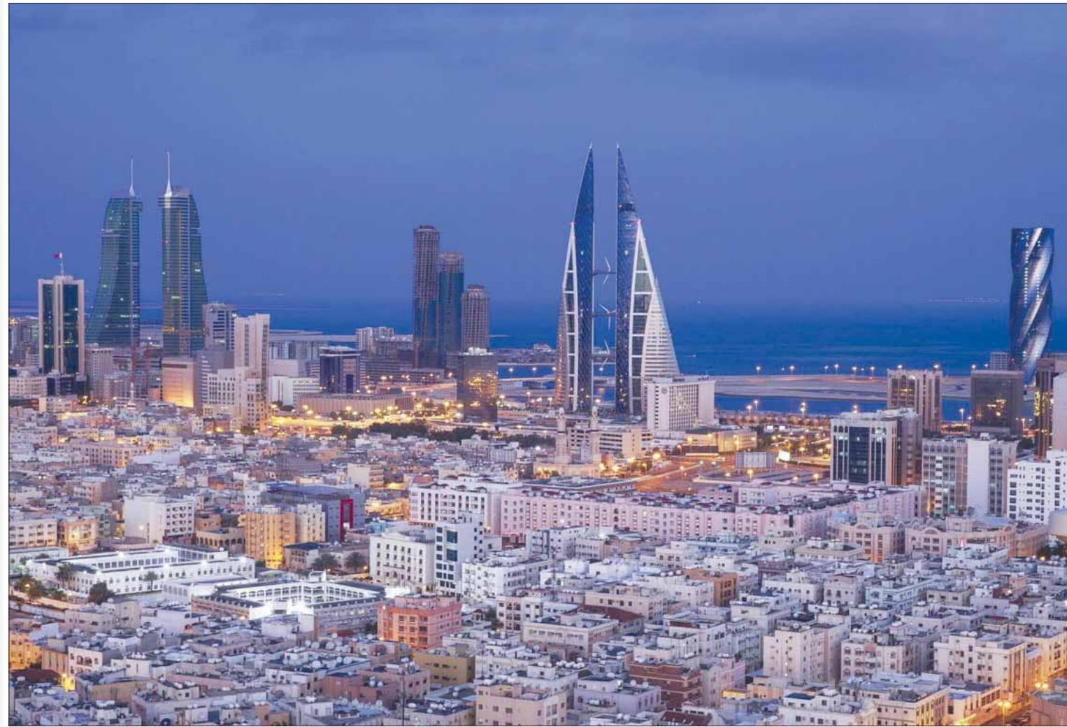
المنامة، عبيد السهيمي

أكد مسؤول بحريني رفيع أن مملكة البحرين تعمل على تطوير بنيتها التحتية لتنمية القطاع السياحي الذي ينمو بشكل مطرد، ويساهم بشكل مؤثر في الناتج المحلي البحريني، ويساهم القطاع السياحي بنحو 6,3 في المائة، بعوائد سنوية تصل إلى نحو 13 مليار دولار.