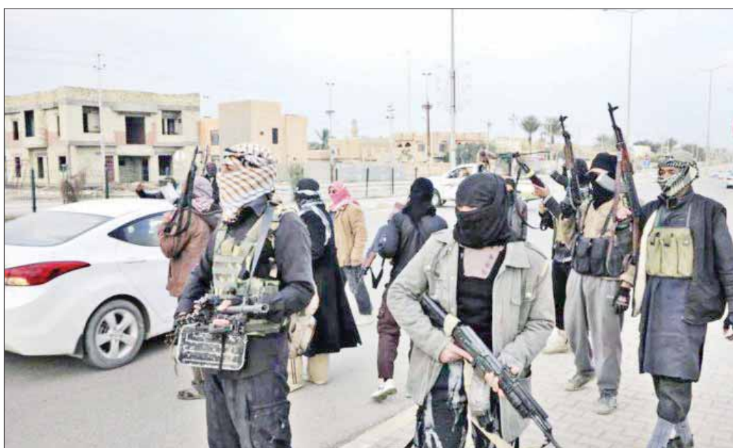
«دواعش» لبيبيون في مدينة سرت (الشرق الأوسط)

الشيء الذي يفرض على الأميركيين والفرنسيين، نوعاً معيناً من السياسة الأمنية والإعلامية. وهو ما عبر عنه الجنرال والداهاوسر، قائد «أفريكوم» في شهادته أمام الكونغرس يوم 6 من مارس 2018 حينما تحدث عن ليبيا، بطريقة مجملية وعمامة، قائلاً: «نحن متورطون بشدة في عملية مكافحة الإرهاب هناك»، وهذا النوع من الخطاب، يشير إلى عدم رغبة قائد «أفريكوم»، في الحديث المفضل عن طبيعة العمل العسكري الأميركي المناهض للإرهاب في ليبيا عامة والجنوب خاصة.