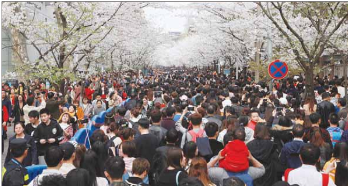
مهرجان أزهار الكرز