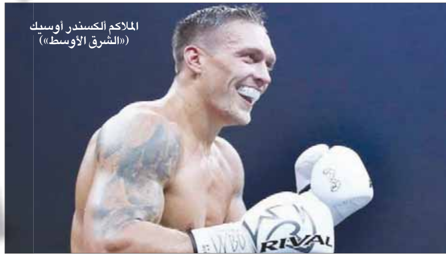
الملاكمة ألكسندر أوسيك

جدة، «الشرق الأوسط» حيث تم تأجيل هذا اللقاء المرتقب، وذلك بعد موافقة اللجنة المنظمة على أمر التأجيل، وقررت تحديد موعد آخر لإقامة المباراة النهائية. يذكر أن الملاكم الأوكراني ألكسندر أوسيك تأهل للمباراة النهائية بعد فوزه على منافسه اللاتفي مارييس بريديس في لاتفيا، وحقق ألكسندر أوسيك انتصاره الرابع (30 عاماً)، ذلك انتصاراً لثلاثين على التوالي، كان 11 انتصاراً منها بالضربة القاضية، ولم يهزم حتى الآن في مسيرته الاحترافية، في حين تأهل الملاكم الروسي مراد غاسيف بعد أن فاز على منافسه الكوبي يونير دورتيكوس، في الدور نصف النهائي من بطولة