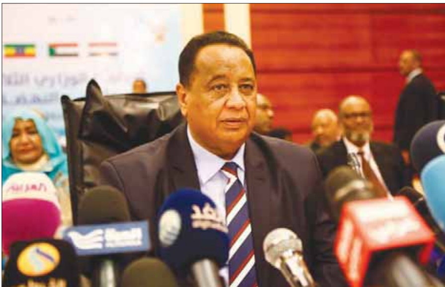
غندور خلال مؤتمر صحفي في الخرطوم الشهر الجاري

وقال غندور لها علاقة قوية بصراع الأجنحة وسط النخبة الحاكمة، وإن هذا الصراع سينكشف بشكل أكثر وضوحاً في اختبار الوزير البديل، ويكشف ما إن كان الحرس القديم للإنقاذ يستطيع العودة إلى الأضواء التي فقدتها في مراحل سابقة، أو أن الرئيس البشير سيتخفف من حمل الإسلاميين الذي يتقل كاهله، ويضيف: «سياسة غندور الخارجية الموالية للغرب كانت بلا نتائج فعلية، ولم تخفف من أزمات النظام السياسية، أو الاقتصادية».