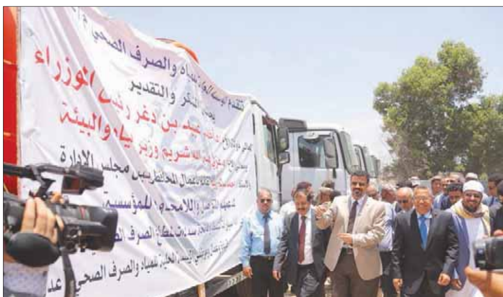
رئيس الحكومة اليمنية لدى تفقده محطة البرزخ لضخ المياه بمنطقة خور مكسر في عدن أمس

القضاء ممارسة عمله». وتابع: «نحن اليوم في المحافظات المحررة قد تجاوزنا كثيراً من الصعوبات والعراقيل التي كانت أمامنا وذلك بعودة عمل مؤسسات الدولة لخدمة الوطن والمواطن»، مشدداً على «ضرورة إنجاز معاملات المواطنين ورفع الظلم عن المظلومين ومعاقبة المجرمين وتنفيذ القانون على الجميع، مع تأكيد على استقلالية القضاء وعدم التدخل في شؤونها».