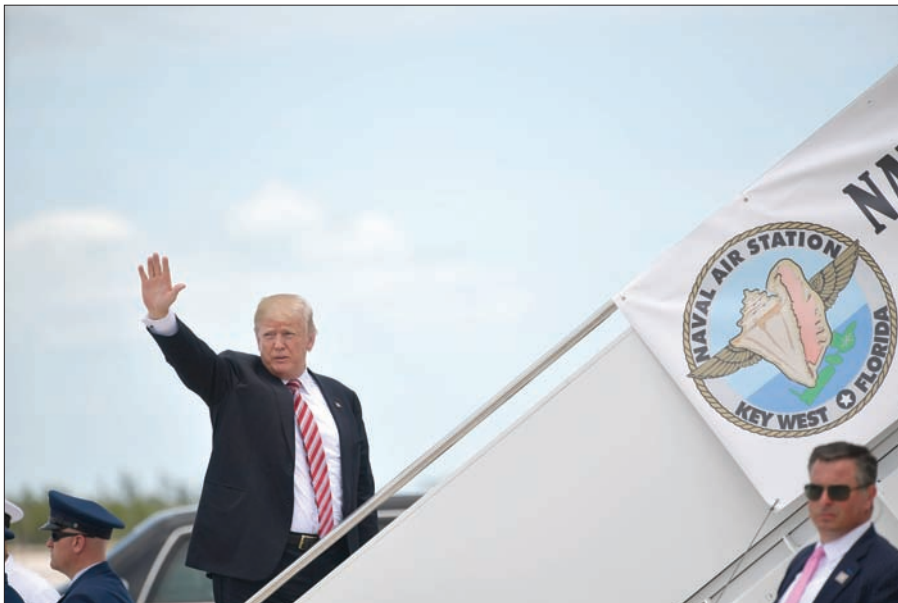
الرئيس الأميركي لدى مغادرته مطار «كي وست» باتجاه فلوريدا الخميس (أ.ف.ب)

ووجه ترمب في مجموعة تغريدات على «تويتر» انتقادات حادة لِمقال نشرته صحيفة «نيويورك تايمز» يتهمه بإساءة معاملة محاميه، ويتوقع أن يتعاون كوهين في نهاية المطاف مع المحققين الفيدراليين. وأعلن ترمب في تغريدة على «تويتر»: «غالبية الأشخاص سينقلون إذا جنبتهم الحكومة المتاعب»، وتابع الرئيس الأميركي: «لا أرى مايكل يفعل ذلك، على الرغم من حملة الاضطهاد الضخمة والإعلام غير النزيه». وأضاف الرئيس الأميركي أن كوهين «شخص صالح ولديه أسرة رائعة. مايكل رجل أعمال ومحام يعمل لحسابه الخاص، لطالما أحبته