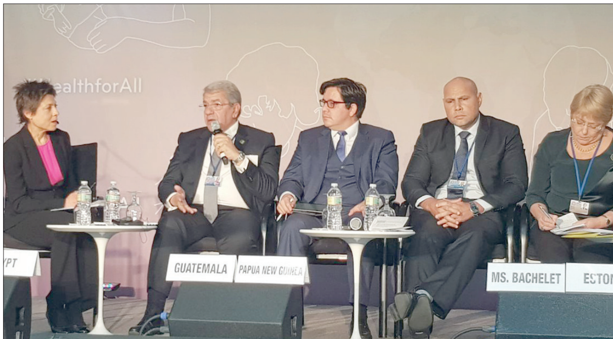
وزير المالية المصري متحدثاً عن نظم تمويل النظام الصحي على هامش اجتماعات الربيع بواشنطن