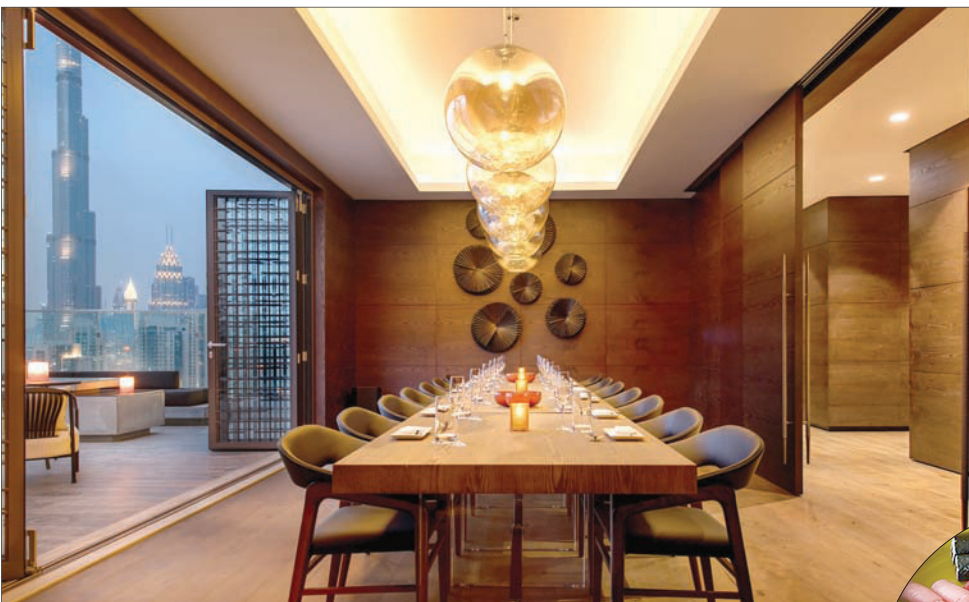
ديكور جميل وغرفة خاصة تتسع لـ 22 شخصاً