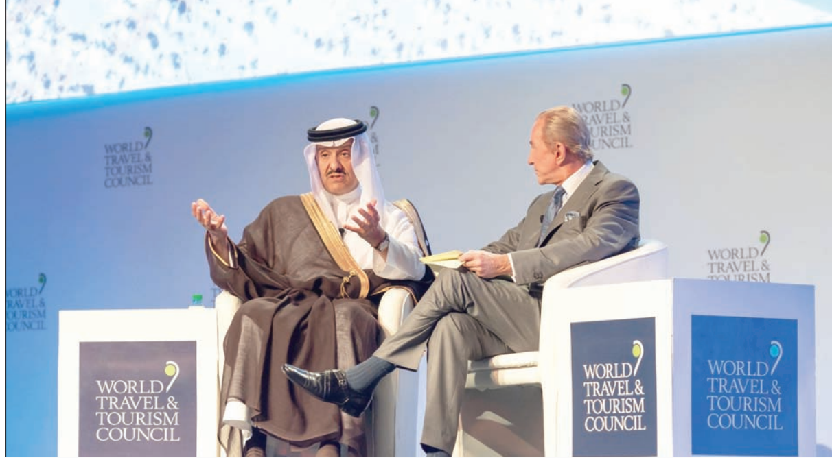
الأمير سلطان بن سلمان خلال حديثه في المؤتمر السنوي للمجلس العالمي للسفر والسياحة