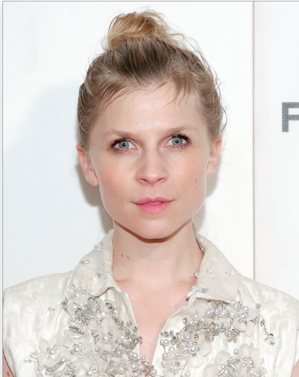
المثلة كلينس بوسي حضرت العرض الأول لفيلم بيكاسو في مهرجان تريبيكا للفيلم في نيويورك (أ ب)