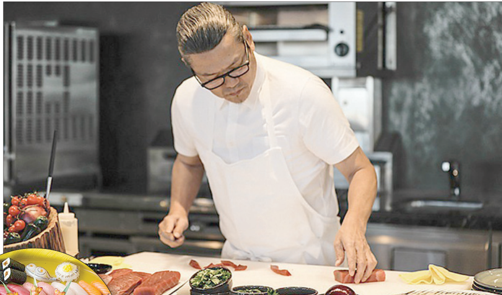
الشيف موريموتو يتمتع بشهرة واسعة على شاشة التلفزيون أيضاً