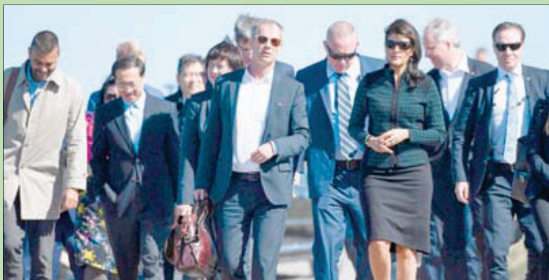
السفيرة الأميركية نيكي هيلي ونظيرها السويدي أولوف سكوفغ لى وصولهما إلى مقر الاجتماع السنوي غير الرسمي للمندوبين لدى مجلس الأمن الدولي في مزرعة بياكاكرا جنوب السويد أمس

موسكو، راشد جبر لندن، الشرق الأوسط - أعلنت منظمة حظر الأسلحة الكيماوية أن خبراءها أخذوا، أمس، عينات من موقع الهجوم الكيماوي في مدينة دوما شرق دمشق بالتزامن مع اجتماع مندوبي الدول الـ 15 في الأمم المتحدة في مزرعة في السويد، لبحث الملف السوري وإصدار قرار دولي. وجاء في بيان للمنظمة أن بعثة تقصي الحقائق التابعة لها زارت دوما أمس، لجمع عينات للتحليل في ما يتصل بالسيارات باستخدام أسلحة كيماوية في 7 أبريل (نيسان) 2018. وأضاف البيان: «العينات التي جمعت ستنقل إلى مختبر منظمة حظر الأسلحة الكيماوية في ريسبيك (ضواحي لاهاي) ثم سترسل للتحليل في مختبرات تابعة للمنظمة». وتابع: «بناء على تحليل نتائج العينات ومعلومات ومواد أخرى جمعها الفريق»، سيتم وضع تقرير يرفع إلى المنظمة. وكانت وزارة الخارجية الروسية أعلنت في وقت سابق، أن الفريق وصل إلى المواقع التي يشتبه بأن مواد سامة استخدمت فيها» في دوما، وذلك في أول زيارة ميدانية لمفتشين دوليين إلى موقع يشتبه بتعرضه لهجوم سام في سوريا. والتقى أمس أعضاء مجلس الأمن الدولي في مزرعة معزولة على الطرف الجنوبي للسويد في مسعى لتخطي الانقسامات العميقة بشأن كيفية إنهاء الحرب في سوريا. حضر اللقاء الأمين العام للأمم المتحدة أنطونيو غوتيريش، ويتوقع أن ينضم اليه الموفد الدولي الخاص إلى سوريا ستيفان دي ميستورا اليوم. وقال غوتيريش لدى وصوله مع عدد من المندوبين: «لا نزال نواجه انقسامات جديدة للغاية بخصوص هذه القضية (سوريا)»، مضيفاً أن «علينا حقاً إيجاد مخرج في ما يتعلق بانتهاك القانون الدولي الذي يشكله استخدام الأسلحة الكيماوية». (تفاصيل ص 6 و 7)