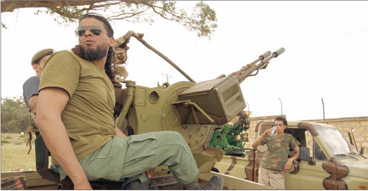
عناصر من قوات موالية للمشير خليفة حفتر قرب درنة

ما هي إلا حقيبة متقلبة ما بين ليبيا وبين الدول الغربية، وليس لها وجود حقيقي على الأرض أو تمثيل في مجلس النواب، وخلص أحميد إلى القول: «هؤلاء لا يمثلون قوة خلفهم، ويبحثون عن مصالحهم، ولا يصلون إلى أي اتفاق». بدوره، قال أحمد قذافي، مدير حسابات على «فيسبوك»، إنه تم الزج بـ«جبهة النضال الوطني» من قبل وسائل إعلام محلية في لقاءات «تجمع عملاء الناتو» الذين ذهب ضحية تامرهم الإف الليبيين الأبرياء»، ووجه انتقادات لاذعة لحزب «العدالة والبناء»، وما سماه بـ«الأحزاب الوطنية التي دنست أرض الوطن». وذهب بعض نواب من غرب البلاد، تحدثوا إلى «الشرق الأوسط»، إلى أن بعض الأطراف التي تعيش خارج البلاد تبحث لنفسها عن دور، بغض النظر عن المصلحة العليا للبلاد. وعبر النواب، الذين تحفظوا على ذكر اسمائهم، عن رفضهم «لأي اجتماعات تتناول الأوضاع داخل البلاد بعيداً عن عين أجهزة الدولة الرسمية». في غضون ذلك، امتنع مجلس النواب أمس عن تأكيد أو نفي احتمال عقد اجتماع هو الأول من نوعه بين رئيسه عقيلة صالح، وبين خالد المشري الرئيس الجديد للمجلس الأعلى للدولة، في المغرب. فيما قالت مصادر مقربة من حفتر لـ«الشرق الأوسط»، إنه تماثل للشفاء بنسبة كبيرة، لكنها رفضت التعليق على معلومات عن خضوعه لعملية جراحية خلال وجوده لتلقي العلاج بأحد مستشفيات باريس. وقال عبد الله بلحبق، المتحدث الرسمي باسم مجلس النواب لـ«الشرق الأوسط»، إن صالح سيزور المغرب لتلبية دعوة وجهت له من رئيس مجلس النواب المغربي الحبيب المالكي، لبحث تعزيز العلاقات الثنائية بين البلدين، مبرزاً أن «المغرب يولي اهتماماً خاصاً بليبيا كإحدى الدول العربية الشقيقة، وضمن دول جوار ليبيا، ومعنية بأمن واستقرار ليبيا، ناهيك عن العلاقات التاريخية بين الشعبين الدولية والوطنية».