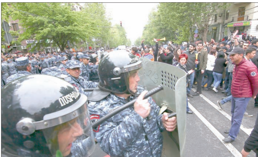
مواجهات بين الشرطة ومتظاهرين في يريفان أمس

واعتقد أنصار المعارضة، سركيسيان، على خلفية تفشي الفقر والفساد وزيادة نفوذ الفئحة الحاكمة، وتولى الضابط العسكري السابق قيادة الدولة الواقعة في جنوب القوقاز، التي تعد 2,9 مليون نسمة، على مدى عقد.