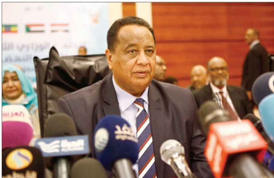
وزير الخارجية السوداني إبراهيم غندور خلال مفاوضات «سد النهضة» بالعاصمة السودانية الخرطوم (أ.ف.ب)