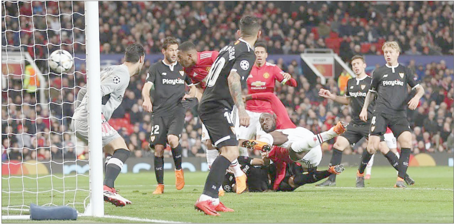
جمهور مانشستر يونايتد لن يغفر لمورينيو بسهولة خروج الفريق أمام إسبيلية في دوري الأبطال

ويجب أن نشير إلى نقطة مهمة في هذا الصدد وهي أن المدير الفني لمانشستر سيتي جوسيب غوارديولا قد جاء للعمل في مدينة مانشستر في الفترة التي جاء فيها مورينيو للعمل مع مانشستر يونايتد أيضاً. وعلاوة على ذلك، فقد خرج مانشستر سيتي من الموسم الماضي خالي الوفاض، في الوقت الذي خال فيه مانشستر يونايتد على لقب كأس رابطة الأندية الإنجليزية المحترفة والدوري الأوروبي. لكن نظراً لأن مورينيو قد أنفق أكثر من 250 مليون جنيه إسترليني على تدعيم صفوف فريقه خلال العام الماضي، فإن مطالباته بالحصول على مزيد من الوقت لتصبح مسار الفريق لن تروق