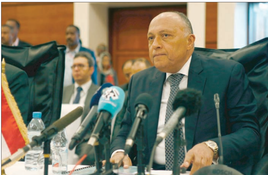
سامح شكري وزير الخارجية المصري خلال مشاركته في اجتماعات «سد النهضة» أول من أمس

الخرطوم: أحمد يونس القاهرة، سوسن أبو حسين