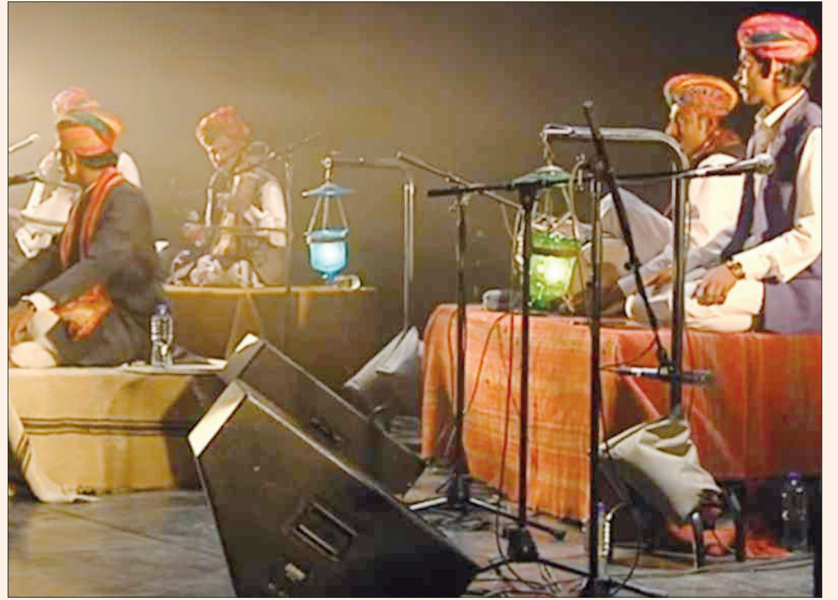
من فعاليات المهرجان