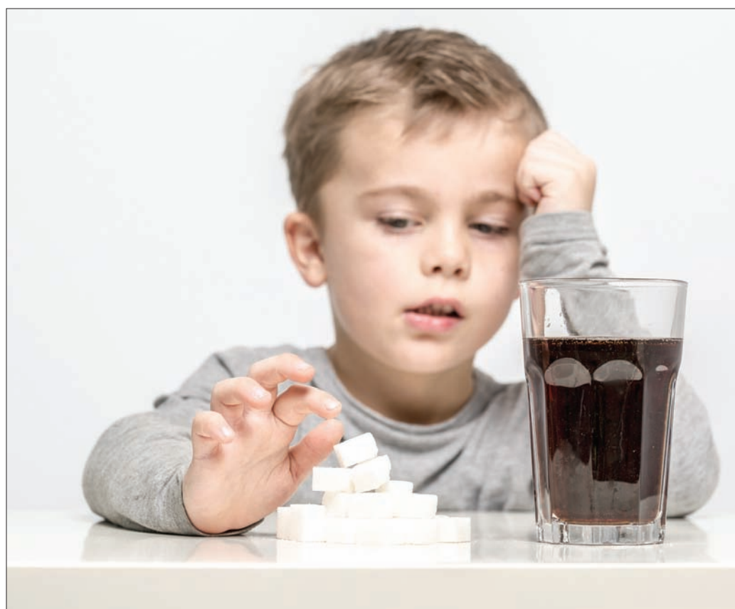
من المتوقع أن يؤثر ارتفاع سعر المشروبات الغازية الناتج من فرض الضريبة على نسبة الاستهلاك

في المقام الأول المصلحة صحة الأطفال، وبالفعل نشاهد تفاعلاً سريعاً من صناعة المشروبات الغازية التي بدأت بتغيير نسب المكونات. وإن كانت الضريبة طريقة واحدة للتعامل مع المشكلة، فإننا نأمل أن الأسعار المرتفعة للمشروبات وزيادة الوعي سيؤدي لاستهلاك أقل من المنتجات المحلاة».