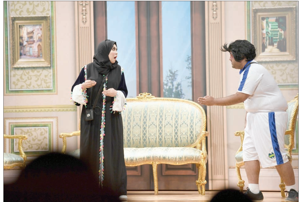
أظهر الممثلون السعوديون الذين شاركوا في المسرحيات إمكانيات كبيرة ومميزة