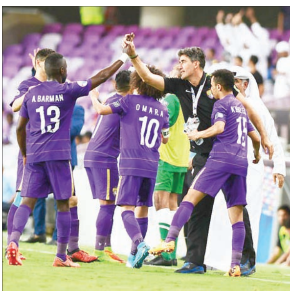
فريق العين بات قريباً من لقب الدوري الإماراتي (الشرق الأوسط)

يواجه الشارقة اليوم السبت، وتوقف رصيد دبا الفجيرة عند 18 نقطة في المركز العاشر. ويمكن للعين التتويج بلقب الدوري غداً إذا خسرت الوحدة أمام الشارقة أو تعادلا، خاصة أن نتيجة المواجهات المباشرة بين العين والوحدة تصب في مصلحة العين، الذي فاز في الدور الأول 1 - صفر وفي الدور الثاني 2 - 0.