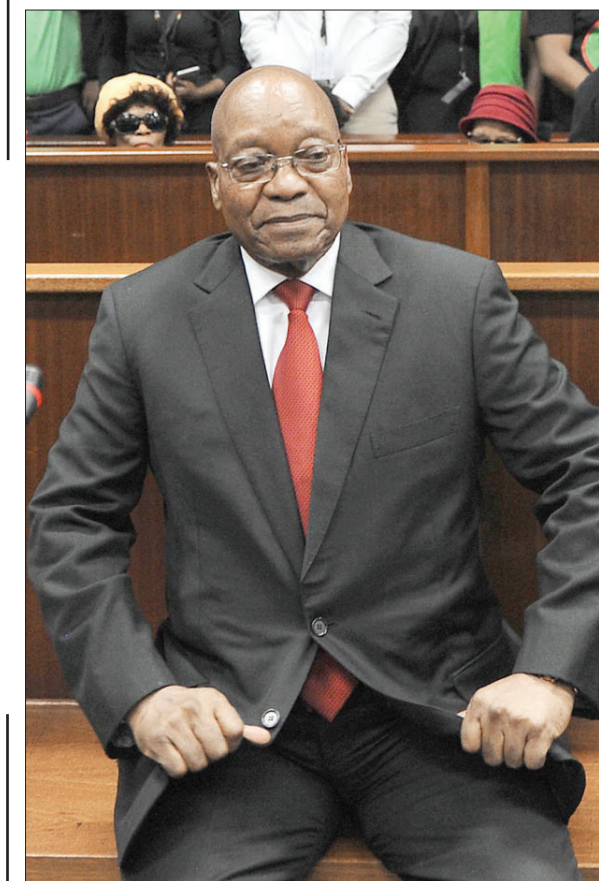
رئيس جنوب أفريقيا السابق أثناء موته أمام المحكمة في دربان

بالفعل أنه مذنب. وأكد محاموه أمام المحكمة الجمعة أن موكلهم سيساتف قرار محاكمته، وهذه خطوة جديدة ضمن معركة قضائية طويلة لإسقاط التهم وتجنب محاكمة يمكن أن تنتهي بقرار سجنه.