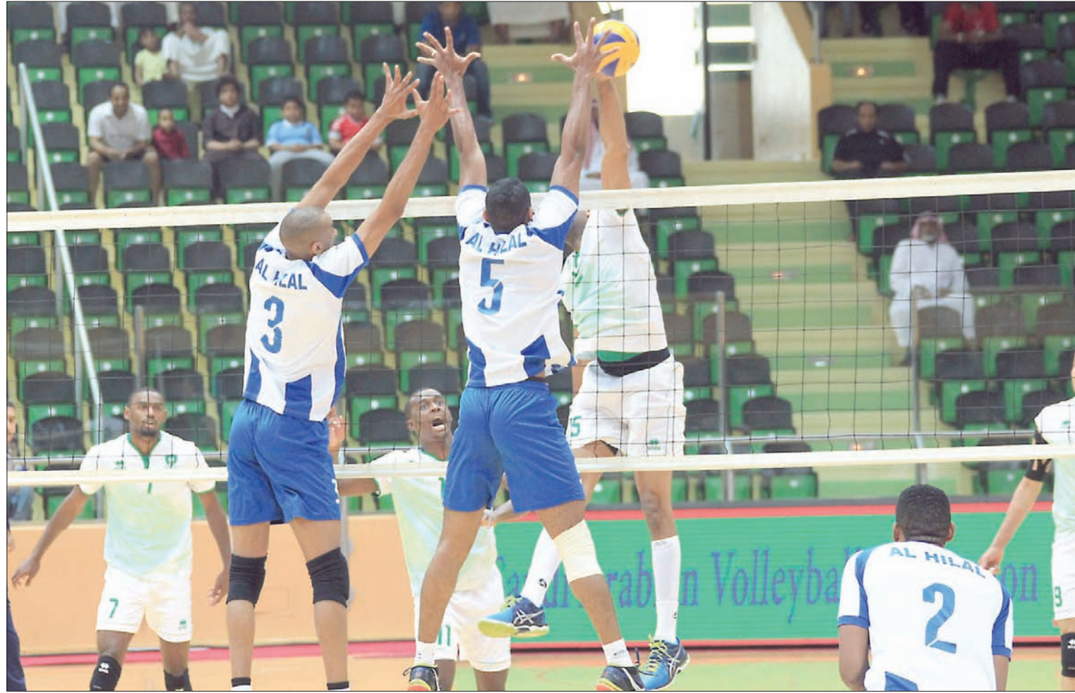
الهلال والأهلي يلتقيان في ختام دوري الطائرة اليوم

يلتقي قطبا كرة الطائرة السعودية الهلال والأهلي، عصر اليوم، في ختام مسابقة الدوري الممتاز. وستشهد المباراة الرئيسية لتتويج فريق الهلال من قبل رئيس الاتحاد السعودي لكرة الطائرة الدكتور إبراهيم الجابيتي.