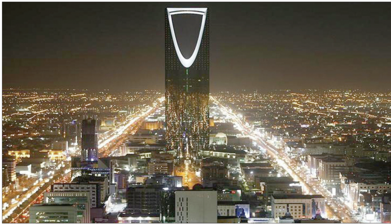
الرياض، «الشرق الأوسط»

الرياض، شجاع البقمي أطلقت السعودية تنظيماً جديداً لمركز كفاءة الطاقة في البلاد، وذلك بهدف ترشيد إنتاج واستهلاك الطاقة بما يكفل رفع كفاءتها، وتوحيد الجهود في هذا المجال، سواء بين الجهات الحكومية أو غير الحكومية، مما يساهم في رفع رتم تنفيذ خطط المركز بما ينعكس على التنمية.