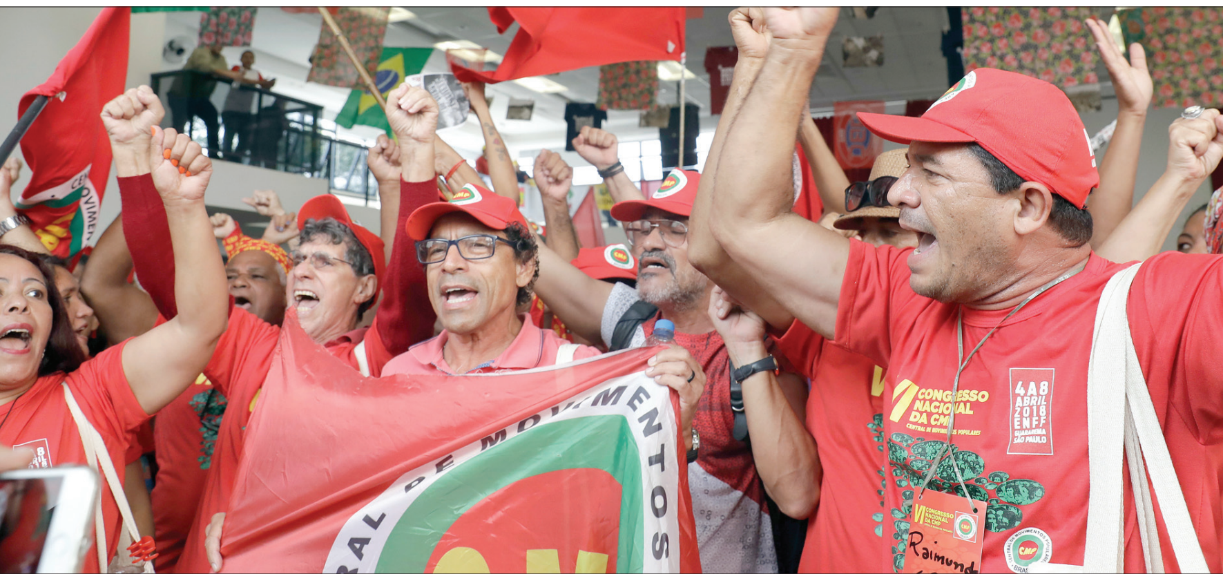
مدريلد، شوقي الرئيس

يبدأ أن الوضع في فنزويلا بلغ درجة من الانهيار وتراجع التأييد الشعبي للنظام بحيث باتت من المستحيل المراهنة على بقائه بالصعوبة الحالية. وما عاد مستبعداً في مثل هذه الظروف، خصوصاً بعد تجميد واشنطن سياسة كبيرة على أورادور لمكافحة الفساد المشتري وتطهير الإدارة من كبار المسؤولين المتهمين بالتواطؤ مع تجار المخدرات والمنظمات الإجرامية التي تنشر الرعب في البلاد، بخشي ناقبون من تقاطع العلاقة المترددة مع واشنطن في هذه المرحلة الحساسة التي يعيد الطرفان خلالها المفاوضات حول «اتفاقية التجارة الحرة» التي تشكل حجر الأساس بالنسبة لعلاقات المكسيك التجارية مع محيطها الإقليمي والركيزة الأساسية لاقتصادها.