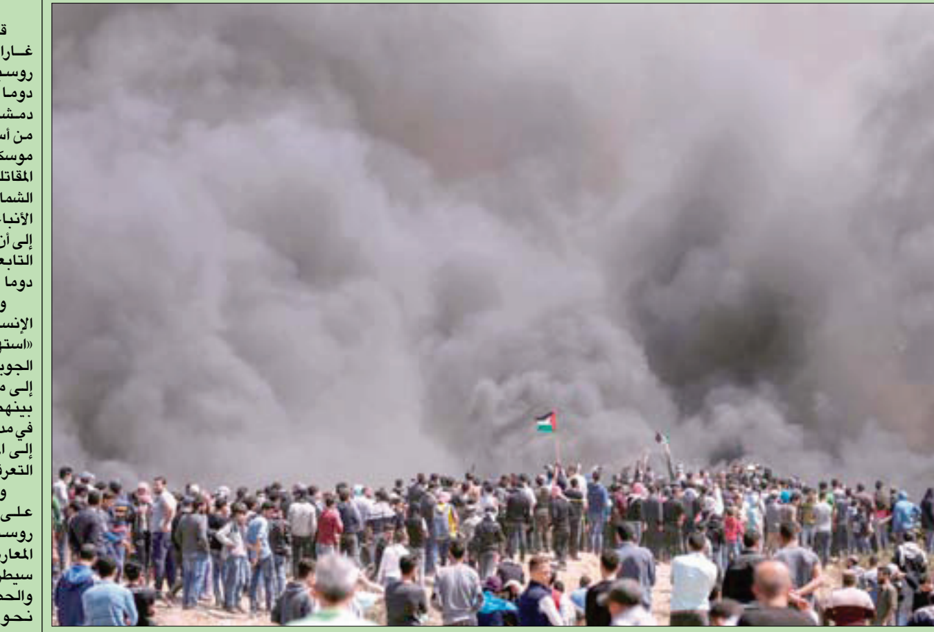
مظاهرون فلسطينيون يتجمعون خلف إطارات مشتعلة خلال مواجهات مع جنود الاحتلال شرق مدينة غزة أمس