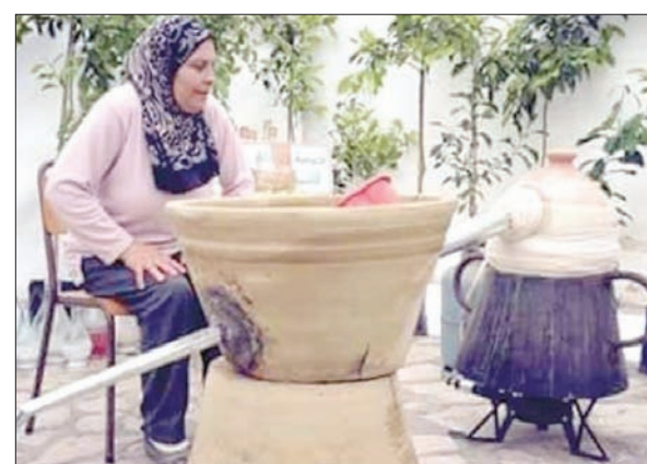
عملية تقطير الزهور المنزلية

هذه المصانع في الجهة إلى سنة 1903 في عهد الاستعمار الفرنسي لتونس. ووصف الفرنسي جون بول جيرلان في كتاب بعنوان «طرق عطورات»، وهو من أشهر منجني العطور الراقية في العالم، زيت روائح الزهر في المدينة عند انطلاق عمليات التقطير التقليدية في المنازل. وأضاف أن عملية التقطير الشاقة تضفي رونقاً خاصاً على العلاجات الأوسرية وتشمع الفرح والسرور بموسم الربيع الحالم بطبيعته، على حد قوله. ويتم تحويل 30 في المائة من الإنتاج باعتماد الطريقة التقليدية وهي بينما توجه النسبة المتبقية وهي في حدود 70 في المائة نحو معامل تقطير الزهر لاستخراج زيت «النيرولي» وعددها 6 مصانع مختصة في تقطير ماء الزهر، ويعود تأسيس أول