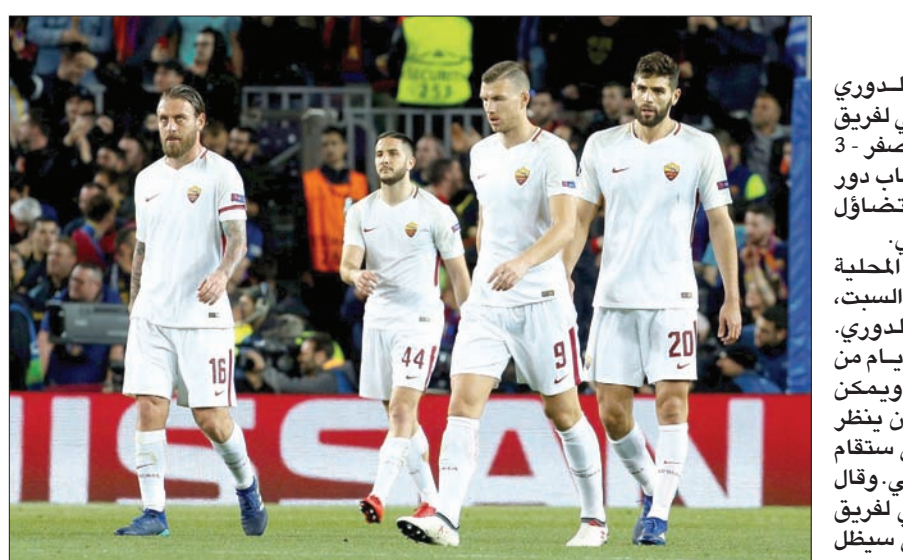
أحزان روما بعد الخسارة الأوروبية