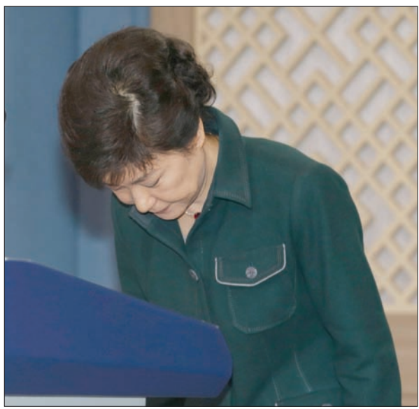
صورة أرشيفية للرئيسة السابقة باك جون-هاي تعود إلى 2013

وكانت المحكمة الدستورية قد أطلحت بك، التي أصبحت أول رئيسة لكوريا الجنوبية في عام 2013 في مارس (آذار) العام الماضي، بعد إقالتها بسبب الفساد في أعقاب أسابيع من المظاهرات، التي كانت تطالبها بالتناحي من منصبها.