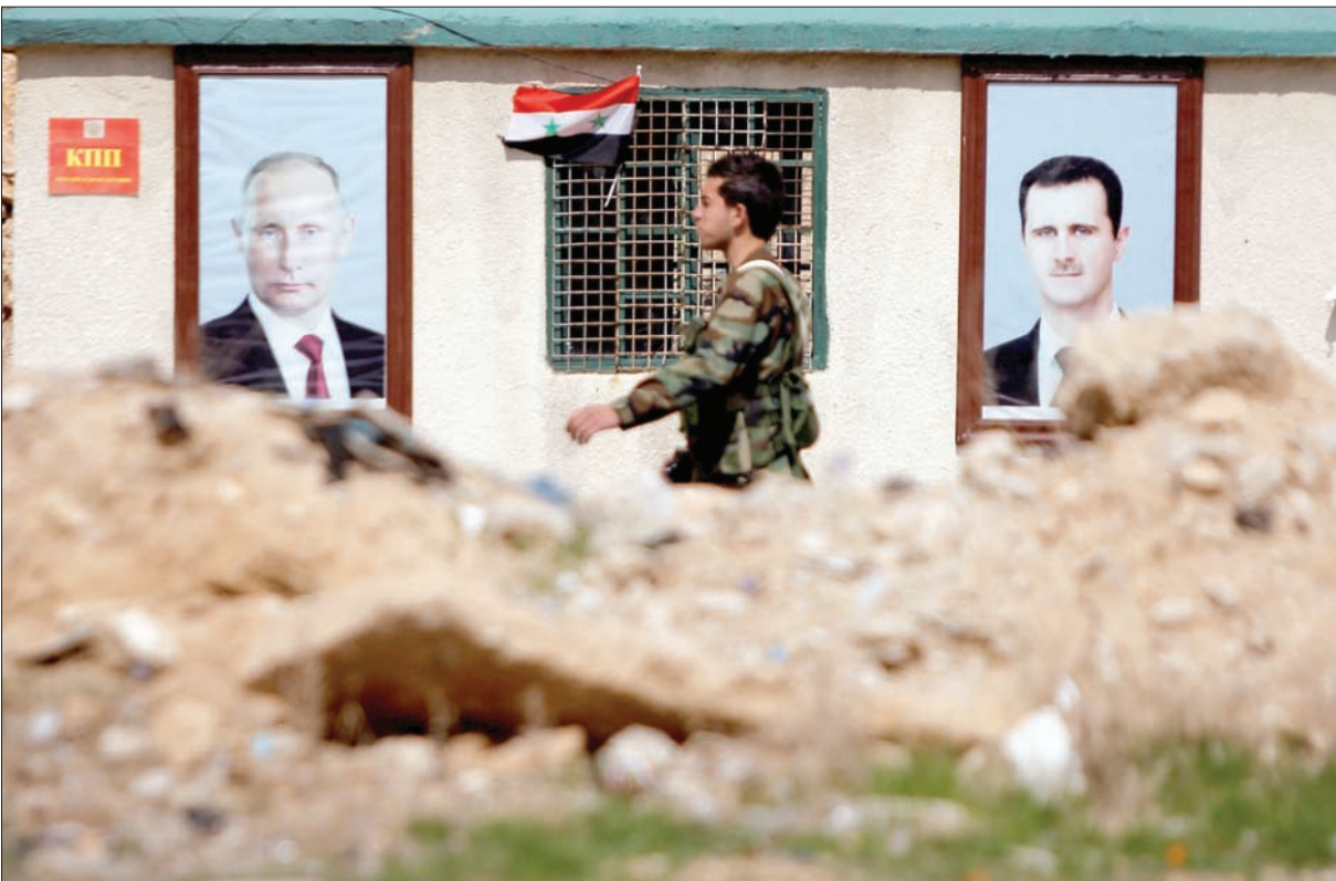
جندي يمر أمام صورتين لبوتين والاسد في غوطة دمشق

أحرار العشائر) الذين سلموا أنفسهم للقوات الحكومية، فإن التشكيلات المسلحة غير الشرعية الناشطة في جنوب سوريا تعمل على إعداد عدد من الاستفزازات، بما في ذلك استخدام مواد سامة».