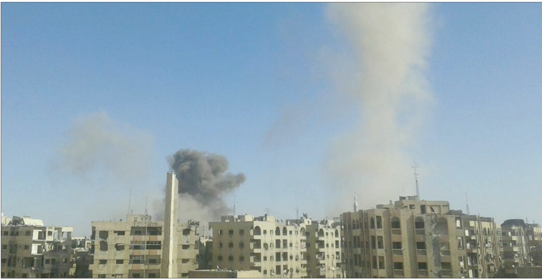
دخان يتصاعد من دوما بعد قصفها من قوات النظام السوري أمس