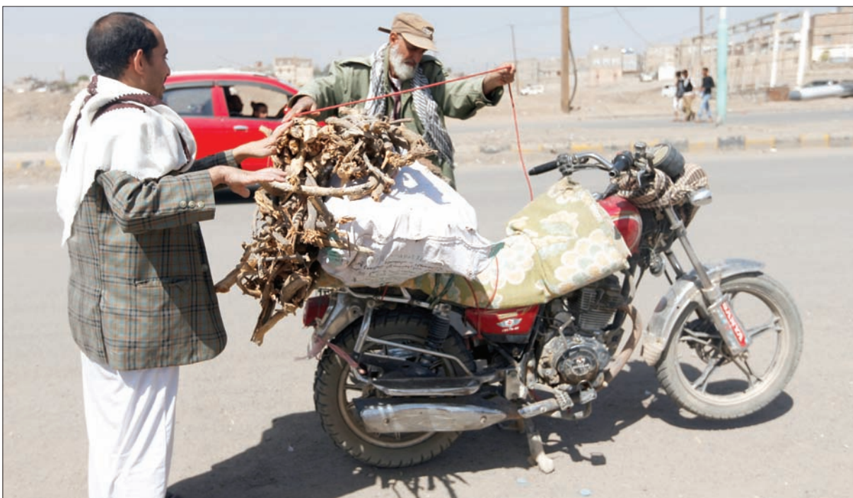
يعني اشتري حطباً في ظل نقص الغاز الذي ألم بصنعاء الخاضعة لسيطرة الحوثيين

الداخلية السابقين إلى الدوريات «الشرق الأوسط» في ميدان التحرير وسط العاصمة صنعاء «بالروح بالدم نفديك يا يمن» هذه الحادثة التي تم توثيقها في مقطع صور متداول على مواقع التواصل الاجتماعي، لم تمر مرور الكرام، إذ أفادت مصادر تريبوية في العاصمة بأن الجماعة اعتقلت إحدى المدرسات مع أبنائها وشقيقها، بعد أن اتهمت بأنها هي المسؤولة عن تمرد طالبات مدرسة «حليمة».