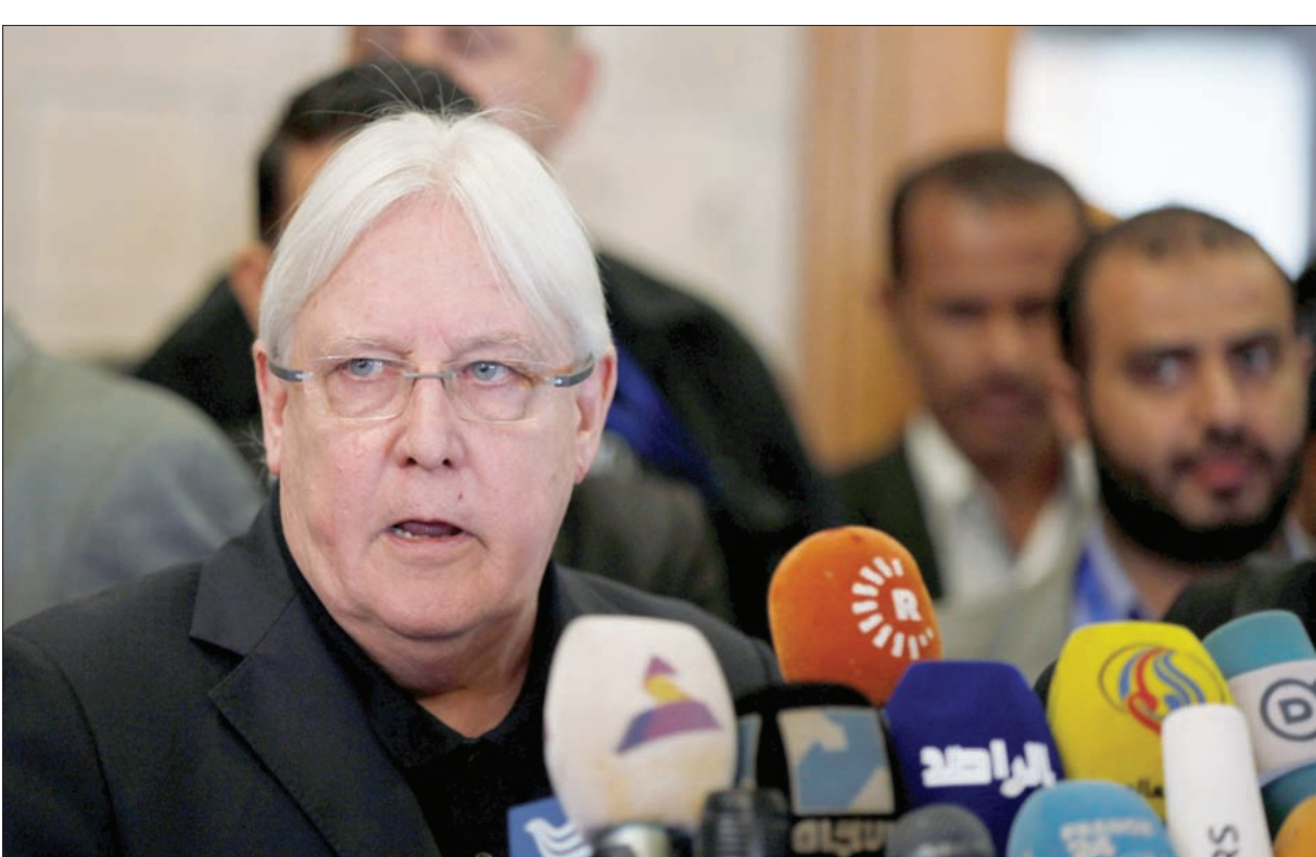
المبعوث الأممي خلال زيارته الأولى لصنعاء، نهاية الشهر الماضي

الجانب الإنساني، للمطالبة بفتح مطار صنعاء، أمام الرحلات الاعتيادية، ورفع الرقابة المسبقة على المياه اليمينية، وذلك في معرض سعيها لاستثمار الشق الإنساني عند الأمم المتحدة، للضغط من أجل فك الحصار المفروض لمنع حصولها على إمدادات السلاح الإيراني، وكذا فتح المنافذ الجوية والبحرية أمام تحركاتها لحشد التأييد وتهريب الأموال.