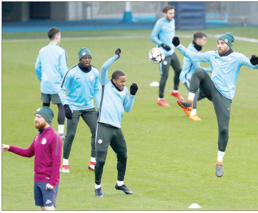
سيتي يتطلع لتصديم جراح سقوطه الأوروبي عبر حسم لقب بطولة إنجلترا

خرج من المباراة الأوروبية ضد سيتي، إلا أن مدربه أبدى تفاؤله بوضعه الصحي. ويبدو ليفربول في وضع مريح لإنهاء الموسم في أحد المراكز الأربعة المؤهلة لدوري الأبطال الموسم المقبل، ويحتل حالياً المركز الثالث بفارق نقطتين خلف يونايتد، وخمس نقاط أمام توتنهام هوتسبير الرابع، وعشر نقاط عن تشيلسي الخامس. إلا أن ليفربول خاض 32 مباراة، مقابل 31 ليونايتد، و30 لكل من توتنهام وتشيلسي الذي سيستقبل «الحمراء» في مرحلة لاحقة.