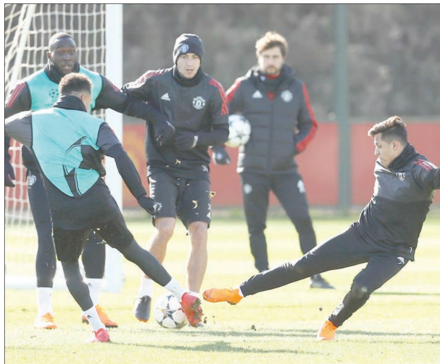
يونايتد يسعى لإفساد فرحة سيتي بالفوز بلقب الدوري على ملعبه (رويترز)

ويتقدم مانشستر سيتي بفارق 16 نقطة عن يونايتد، ويبدو تتويجه باللقب الثالث في الدوري الممتاز والخامس في تاريخ بطولة إنجلترا مسألة وقت، لكن المحسوم أن نكحة التتويج على حساب يونايتد بالذات ستكون مختلفة، في ظل التنافس التاريخي بين قطبي المدينة الإنجليزية الشمالية. ويأمل غوارديولا في تحقيق باكورة لقبه في الدوري الإنجليزي في القابض على الدوري مع سيتي، علماً أنه أحرز هذا الموسم كأس رابطة الأندية على حساب أرسنال. إلا أن ما يُؤرق المدرب السابق لبرشلونة الإسباني بابلو إنريكيه الإسباني هو أن المباراة تأتي قبل ثلاثة أيام من استضافته ليفربول في إياب دور الثمانية لدوري أبطال أوروبا (صفر - 3 ذهاباً)، ما يضعه أمام صعوبة اختيار التشكيلة التي ستخوض المباراة ضد يونايتد. وقال غوارديولا: «أعلم ما الذي يعنيه ذلك، سيكون مثل حصد برشلونة للقب في مدريد، أو ريال في برشلونة، سيكون استثنائياً». وخسر يونايتد ثمانية من آخر 13