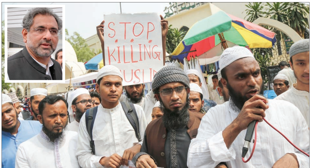
مواطنون من بنغلاديش يتظاهرون بعد صلاة الجمعة في العاصمة دكا احتجاجاً على مقتل طلبة في مدرسة دينية في غارات على قندوز الأفغانية... وفي الإطار رئيس وزراء باكستان قبل وصوله إلى كابل أمس (أ.ب) (ب)

اتهمت أفغانستان، أول من أمس، باكستان، بتنفيذ ضربات جوية تسببت في «أضرار مالية جسيمة» في إقليم كونار الواقع على حدودها مع باكستان. ويسلط هذا التطور الضوء على الثقة المفقودة منذ فترة طويلة بين الجارتين، رغم مساعي البلدين لتحسين الأوضاع الأمنية. وجاءت الواقعة قبل زيارة رئيس وزراء باكستان شاهد خاقان عباسي إلى كابل، أمس، لإجراء محادثات مع الرئيس الأفغاني أشرف غني بشأن سبل التعاون لوقف هجمات المتشددین. وقالت وزارة الشؤون الخارجية في أفغانستان، في بيان، إن مقارنات باكستانية أسقطت 4 قتيلين في منطقة دانجام فيكونار. ولم تذكر الوزارة أي تفاصيل عن الأضرار أو الإصابات الناجمة عن ذلك، وأضافت الوزارة: «تحدث أفغانستان من أن الانتهاكات المستمرة للإعراف الدولية... ستكون لها عواقب وخيمة على العلاقات بين الدولتين». لكن باكستان رفضت الاتهامات