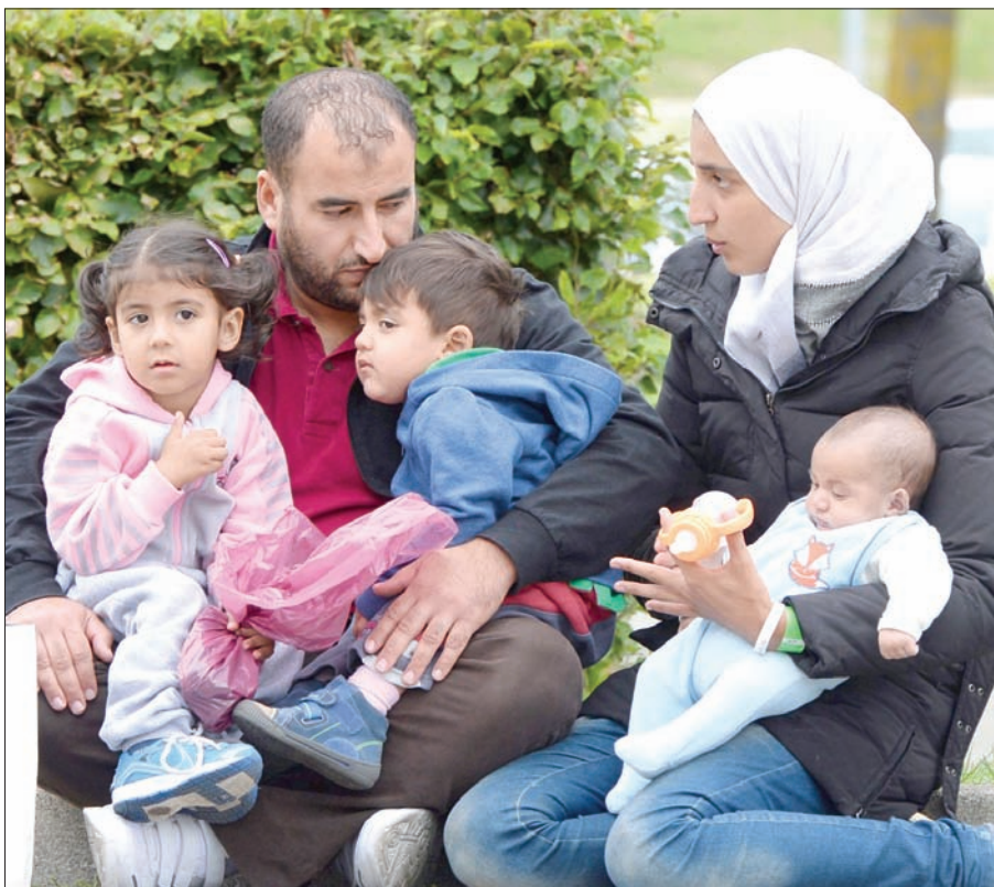
عائلة سورية لاجئة تنتظر في مدينة ميونيخ الألمانية دورها لدخول مأوى للاجئين

اللاجئين تحدياً لهدوء المجتمع الألماني، جعل الحكومة تحد من استقبال اللاجئين، وتتناهى في دراسة ملفات طلبات اللجوء. ومع بدء تطبيق اتفاقية دبلن، لم تعد ألمانيا تقبل باللاجئين القادمين من دول أوروبية أخرى، بل تعيدهم فوراً إلى البلد الذي مروا ويصوموا به».