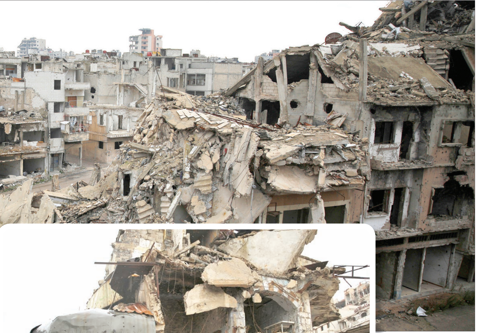
حمص (وسط سوريا) «الشرق الأوسط»

بعد سبع سنوات من الحرب، تبدو حمص، مدينة المتناقضات الصارخة، بين أحياء مدمرة يسميها معارضون بـ«ساليغراد سوريا»، وأخرى تقطنها غالبية موالية للنظام تسورها حياة طبيعية، ما أدى إلى شرح كبير بين الشرائح الاجتماعية.