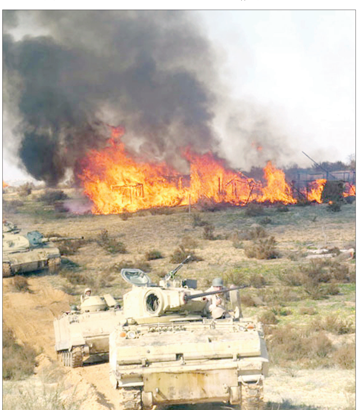
صورة نشرها موقع الجيش المصري على «فيسبوك» لمهاجمة أوكار الإرهابيين

وقال باحثون إن «الظواهري يحاول العودة لمشهد الجهاد العالمي (المزعوم)... كما يحاول جاهداً الإبقاء على (القاعدة) بوصفها تنظيمًا متماسكاً، رغم أنه بالفعل تفكك خلال السنوات الماضية». من جهتها، أوضحت دار الإفتاء، أن رسالة الظواهري محاولة بائسة منه لرفع معنويات الجماعات والتنظيمات الإرهابية التي أصبحت في «الحضيض» بسبب نجاح العملية العسكرية الرئيسية، وتعزيز التواجد الأمني بمحيط المنشآت الحيوية والمواقع الشريطية، تزامناً مع حرب الدولة على الإرهاب. وكانت وزارة الداخلية في مصر، قد شددت الإجراءات الأمنية ورفعت حالة الاستنفار الأمني بمحيط المنشآت المهمة