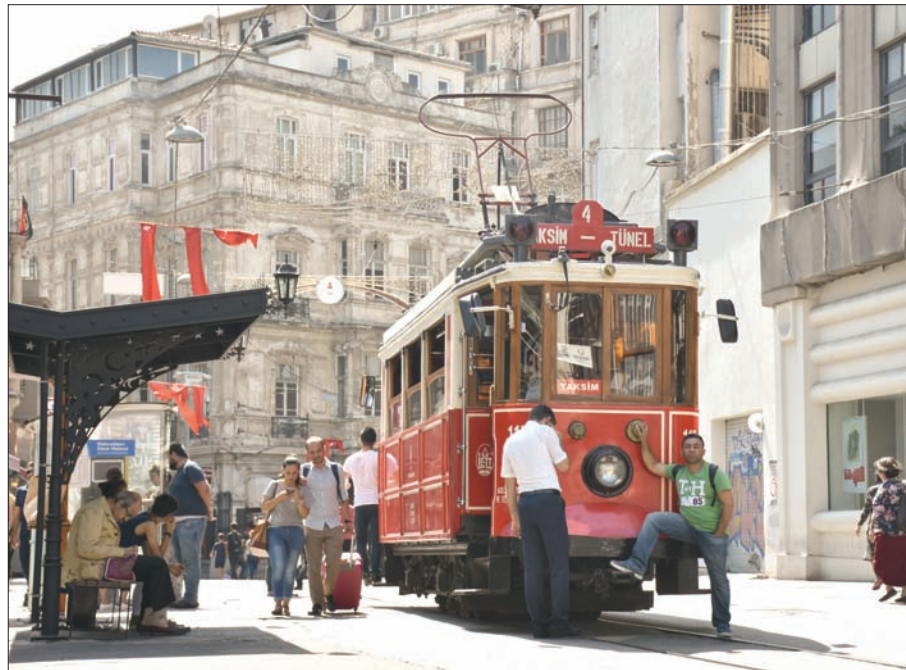
ساهمت عمليات إعادة الهيكلة في رفع عائدات الميزانية بحوالي نصف مليار دولار

وأضاف البيان أن الشركات التركية ستستفيد من مشاريع استثمارية كبرى مثل تشييد الطرق، والجسور، والسدود، والفنادق، والمدارس، ومساحات طلاب الجامعات والرياضة، والصناعة، والتعدين، والزراعة، والمواد الغذائية، والطاقة. في السياق ذاته، دعا وزير الخارجية السوداني إبراهيم غندور رجال الأعمال الأتراك لتنفيذ مشاريع استثمارية في بلاده، لتعزيز التعاون الاقتصادي بين البلدين. ولفت غندور في تصريحات لوكالات أنباء الأناضول أول من أمس عقب لقائه الرئيس التركي إلى أن بلاده تتمتع بإمكانات كبيرة في مجال الاستثمار، وخصوصاً في قطاعي الزراعة والتعدين.