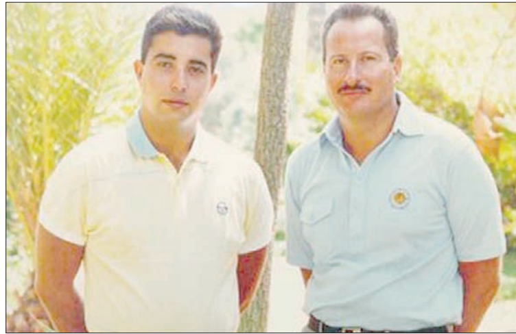
أكرم مع أخيه الملك أحمد فؤاد الثاني

ولكن لكل أجل كتاب، اللهم أنزله منزل صدق وأغسله بالماء والثلج والبرد، ليلحق بأحبابه والده الدكتور أدهم النقيب والدته الملكة ناريمان». ولد أكرم النقيب في 28 مارس (آذار) عام 1961، وكانت والدته الملكة ناريمان قد تزوجت عقب طلاقها من الملك فاروق، الطبيب