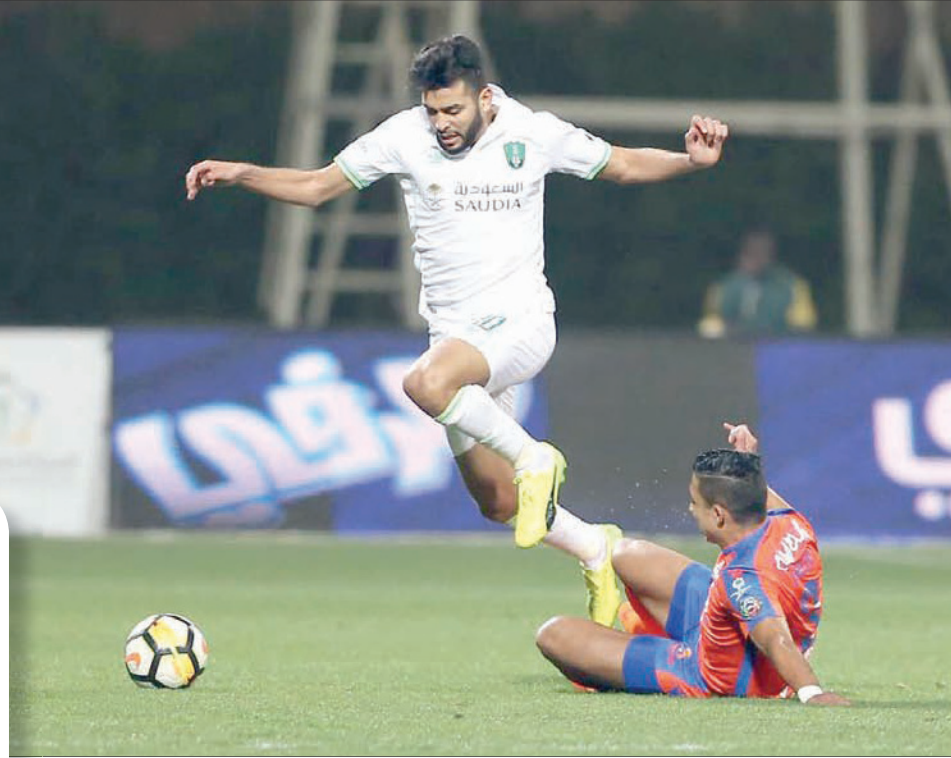
من مواجهة الأهلي والفيحاء أمس

الأفراح الهلالية لم تدم طويلاً بعدما استفاق الشبابيون من صدمة الهدف الباهر الذي كاد