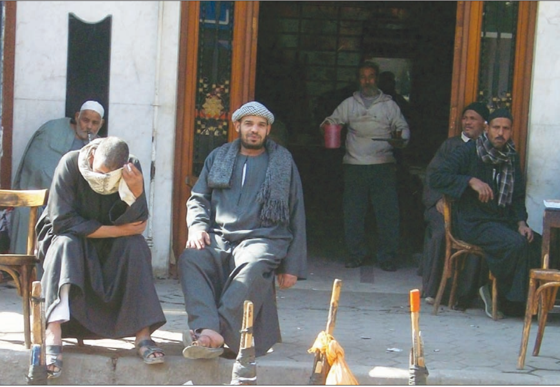
عمال اليومية ينتظرون رزقهم في مقهى حفظ ملامحهم