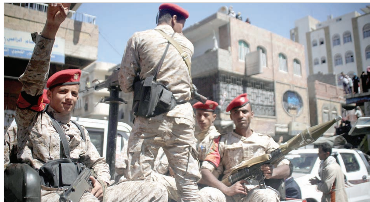
عناصر من الشرطة العسكرية يؤمنون مظاهرة لإحياء، ذكرى الثورة التي أطاحت الرئيس صالح في تعز أمس

ونقل الموقع عن مصدر ميداني قوله: «إن قوات الجيش دكت مواقع الميليشيا الحوثية المتمركزة في منطقة الكعاوش، وتية الدعي، حيث أسفر المعارك والقصف عن سقوط عدد من القتلى والجرحى في صفوف الميليشيا الحوثية». وكانت القوات الحكومية قد صدت هجوماً آخر للميليشيات، أول من أمس، في جبهة «الصلو» جنوبي تعز، حيث تحاول التقدم في مديرية «منة خدير» حيث الطريق الرئيس الذي يصل تعز جنوباً بمحافظة لحج وعدن. وقصف طيران التحالف حسب مصادر رسمية «تجمعات ميليشيا الحوثي الانقلابية في مناطق متفرقة شرقي تعز، بالتزامن مع استمرار المعارك في العديد من الجبهات الميدانية».