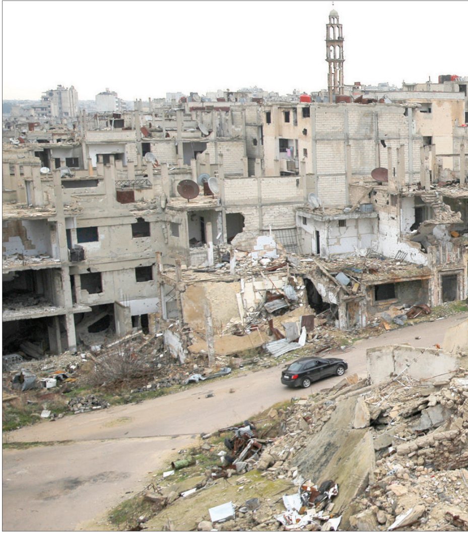
سيارة في أحد أحياء حمص المدمرة وفي الأطلال فتاتان تنتظران سيارة أجرة قرب الدمار