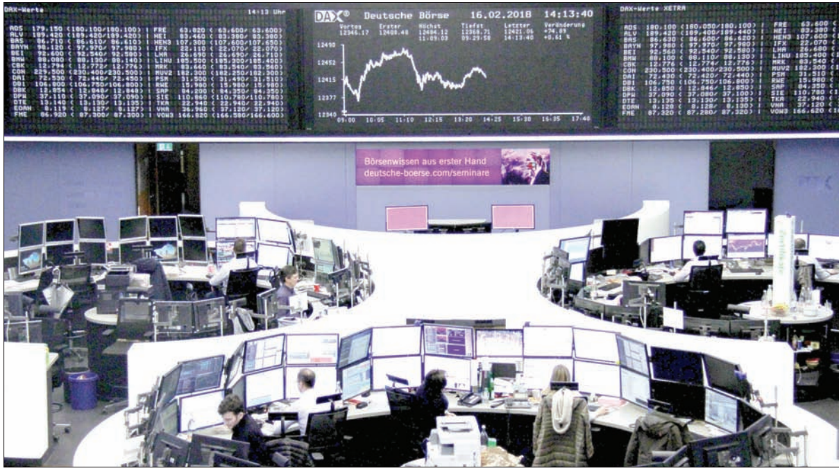
الأسهم الأوروبية تتجه لإنهاء موجة الخسائر

وتذبذب أداء الدولار، حيث هبط في مستهل التعاملات ثم ارتفع من أدنى مستوى في ثلاث سنوات مقابل سلة عملات، لكنه اتجه صوب تكبد أكبر خسارة أسبوعية في تسعة أشهر، في الوقت الذي فاقت فيه المعنويات السلبية للمستثمرين تجاه الدولار أثر