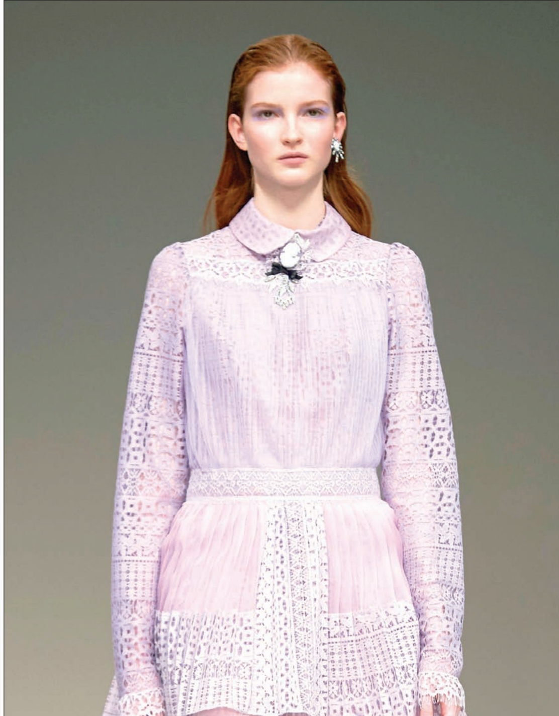
عارضة تقدم زيا للمصمم التركي بورا اكسو في اليوم الأول لأسبوع أزياء فصلي الخريف والشتاء في لندن

كان ربي قد رماني بين براثن امرأة في مجال عملي، وورثني الأمرين من طولة لسانها، فالنقاش معها كان أشبه ما يكون بمن يحاول إطفاء لمبة كهربائية بنفخة من فمه. كانت من دون مبالغة، تفعل كل شيء بصوت مرتفع، حتى لو لم تكن تفعل شيئاً. يا ساتر (!!!)، لقد ظلمت أنا الأطفال عندما قلت عنهم: إنه ليس لهم حل، الواقع أن بعض النساء مثل تلك اللبوة؛ هن اللواتي ليس لهن حل - إلا بما صنع الحداد.