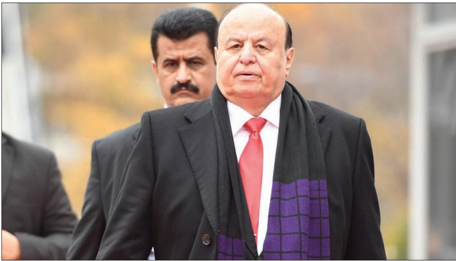
الرئيس اليمني عبد ربه منصور

وفي سياق الجهود الحكومية الميدانية، تفقد بن دغر محطات توليد الكهرباء الواقعة في «خور مكسر»، واطلع على مستوى جاهزيتها لمواجهة الصيف المقبل، كما أجاز الستار عن مشروع إنارة مطار عدن الدولي ومدرج المطار بتكلفة 200 مليون ريال يمني؛ إذ سيتم إمداد المطار بكابلات مستقل يعمل على مدار الساعة.