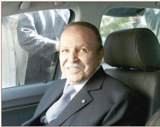
الرئيس الجزائري عبد العزيز بوتفليقة

بالمغرب العربي بخصوص الموضوع نفسه، لكن لا شيء تحقق. ويعود السبب، بحسب بعض المراقبين، إلى استمرار التناقض بين أكبر جارين بالمنطقة حول نزاع الصحراء. فالجزائر تدعم فكرة استقلال الصحراء، بينما تتمسك الرباط بمشروع «الحكم الذاتي في إطار السيادة المغربية».