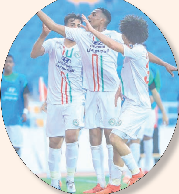
لاعب الاتفاق يحتفلون بهدف الفوز على الرائد أمس