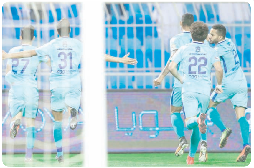
لاعب الهلال يحتفلون بالهدف الأول أمام الشباب