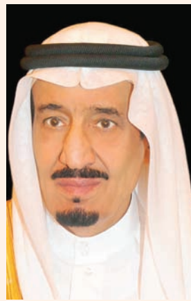
الرياض، «الشرق الأوسط»

بإسم شعب وحكومة المملكة العربية السعودية، وباسمنا بالغ التعازي، وصادق المواساة».