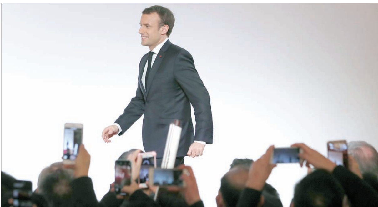
الرئيس ماكرون يستعد لإلقاء كلمة في الإليزيه بمناسبة الاحتفال بالسنة الصينية الجديدة أمس

إيف لو دريان بحق إيران، واتهامها بـ«نزع الهيمنة» على المنطقة، ومد نفوذها «من طهران إلى المتوسط»، واعتبار أن برنامجها الصاروخي الباليستي «خارج عن الرقابة»، حسب ماكرون. أما لو دريان فيرى أنه يخالف القرار الدولي رقم 2231 الذي «يفرض قيوداً على نشاطات طهران الباليستية». لذا، فإن ماكرون يريد «وضع النشاطات الباليستية الإيرانية تحت الرقابة» لأن ذلك «ضروري لأمن المنطقة، ما يفترض وجود البات مناسبة لممارسة الرقابة وفرض العقوبات».