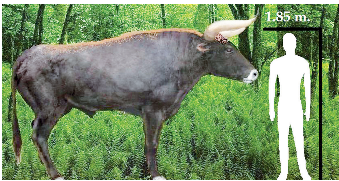
لورش (ألمانيا)، «الشرق الأوسط»