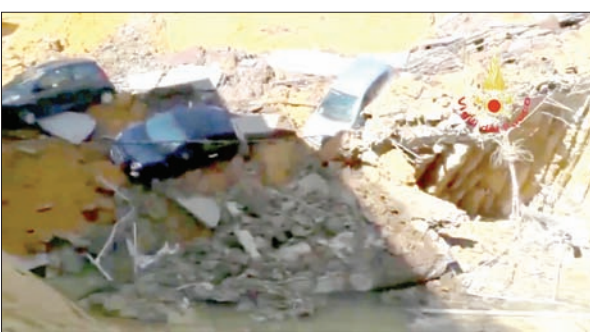
بعض السيارات التي سقطت في الحفرة العميقة في العاصمة الإيطالية روما

روما، «الشرق الأوسط» تسبب انهيار أرضي ضخم في انتشار الفوضى في منطقة سكنية في العاصمة الإيطالية روما مما أدى إلى ابتلاع 6 سيارات وهروب 20 أسرة من مساكنها. واطهرت الصور حفرة عميقة بعد انهيار الشارع في نحو الخامسة والنصف بعد الظهر في حي بالدونيا. وقد انتقلت فرق إطفاء للمنطقة لإخلاء المسكن القريبة كإجراء احترازي. وقد أكدت عمدة روما فرجينيا راغي في تصريحات للصحافة المحلية عدم إصابة أي شخص بسبب الحادث وأنه تم نقل السكان الذين تم نقلهم من منازلهم إلى