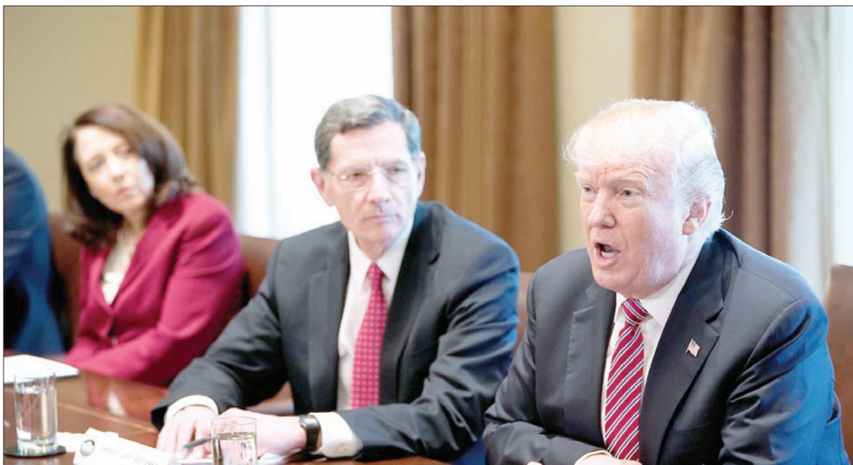
الرئيس ترمب خلال اجتماع في البيت الأبيض مع بعض أعضاء الكونغرس

بالولايات المتحدة، الذين ليس لهم سجل إجرامي ولم يرتكبوا أي جريمة مخالفة للقانون. وتم تقديم هذا المقترح برعاية كل من السيناتور مايك راوندز والسيناتور أنغوس كينغ