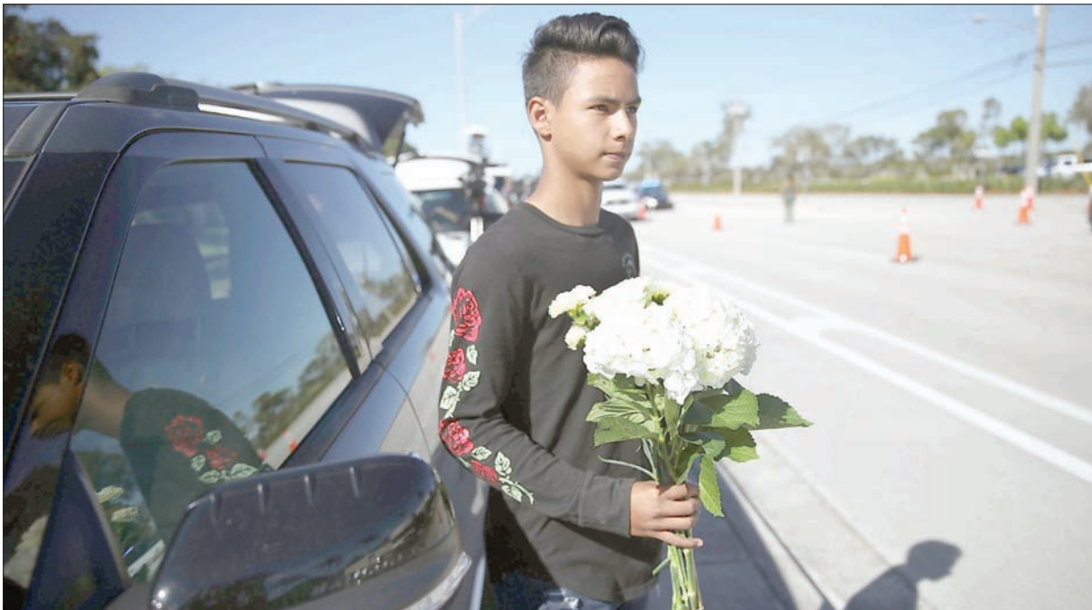
أحد الطلاب يشارك في جنازة زميلته قتيلا المجزرة التي راح ضحيتها 17 طالباً من مدرسة في فلوريدا

في الغالب من الجمهوريين بنسبة 81 في المائة، فيما تمثل نسبة المؤيدين من الديمقراطيين 19 في المائة. بدور، قال الرئيس الأميركي دونالد ترمب، عبر حسابه على موقع «تويتتر»، إنه مغادر إلى فلوريدا أمس «اللقاء بعض من أشجع الناس على وجه الأرض، الذين تم تحطيم حياتهم تماماً، وأنا أعمل أيضاً مع الكونغرس على كثير من الجبهات». وفي خطاب نشره البيت الأبيض أمس، قال الرئيس ترمب إن «أمتنا تحزن مع أولئك الذين فقدوا أحبائهم في إطلاق النار على مدرسة مارجوري ستونيمان دوغلاس الثانوية، في باركلاند بفلوريدا. وكندليل على الاحترام الرسمي لضحايا أعمال العنف، ووفقاً للسلطة الممنوحة لي بصفتي رئيساً للولايات المتحدة بموجب دستور الولايات المتحدة الأميركية وقوانينها، أطلب بتكتيس علم الولايات المتحدة إلى النصف في البيت الأبيض، وفي جميع المباني والأراضي العامة، وفي جميع المواقع العسكرية والمحطات البحرية، وعلى جميع السفن البحرية التابعة للحكومة الاتحادية في مقاطعة كولومبيا، وفي جميع أنحاء البلد والولايات المتحدة وأقاليمها وممتلكاتها حتى غروب شمس يوم 19 فبراير (شباط) 2018».