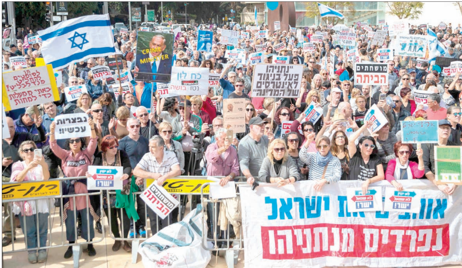
إسرائيليون يتظاهرون مطالبين رئيس الوزراء بنيامين نتنياهو بالاستقالة في تل أبيب أمس (أ.ف.ب)

في أول نشاط جماهيري منذ توصية الشرطة الإسرائيلية بتقديم لائحة اتهام ضد رئيس الوزراء بنيامين نتنياهو، بسبب شبهة قوية بارتكابه مخالفات تلقي رشي وغيرها من تهمة الفساد، تظاهر الآف الإسرائيليين، ظهر أمس الجمعة، وسط مدينة تل أبيب، مطالبين بتقديم الاستقالة، وداعين المستشار القضائي للحكومة، أبحاثا من قبله، إلى تسريع إجراءات إصدار قراره في شأن تقديم لائحة اتهام بحق نتنياهو، وعدم الماطلة في هذه المهمة، ورفع المتظاهرون لافتات كتب عليها: «مرتبون، عودوا إلى منازلكم»، و«خلينا كنس المرتشين» و«استقل فوراً» و«نتنياهوو يعمل ضد مصلحة الدولة».