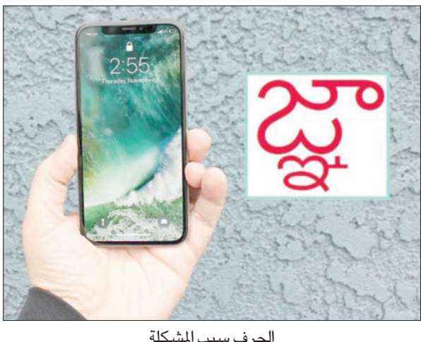
الحرف سبب المشكلة

جدة: خلدون غسان سعيد إن كنت من مستخدمي أجهزة «آبل» المحمولة التي تعمل بنظام التشغيل «أي أو إس 11.2,5» أو الكومبيوترات الشخصية التي تعمل بنظام التشغيل «ماك أو إس» أو ساعة «آبل» الذكية أو جهاز «آبل تي في»، فعليك توخي الحذر من قبلة رقمية جديدة تصيب هذه الأجهزة ملغية قدرة المستخدم على قراءة الرسائل النصية وتطبيقات الدردشة مثل «واتساب» و«فيسبوك ميسنجر» و«أي ميسنج» وحتى تطبيقات البريد الإلكتروني «أوتلوك» و«جي ميل».