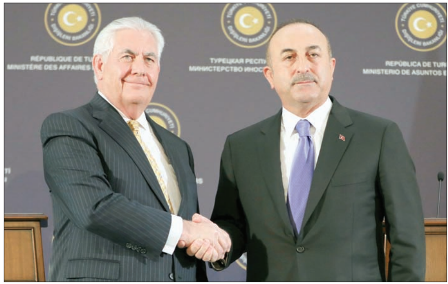
وزيرا الخارجية الأميركي والتركي في أنقرة أمس

والنقى جاويش وأغلو نظيره الأميركي في أنقرة، أمس، في جلسة مباحثات ثنائية، أعقبها جلسة موسعة بمشاركة الوفد الأميركي المرافق لتيلرسون ومسؤولين في الخارجية التركية. وجاءت زيارة تيلرسون إلى أنقرة ومباحثاته مع المسؤولين الأتراك بعد زيارة مماثلة لمستشار الأمن القومي الأميركي ماكماستر، يومي السبت والأحد الماضيين، حيث التقى المتحدث باسم الرئاسة التركية إبراهيم كالمين لبحث التوتر حول الملف السوري ودعم المليشيات الكردية والقضايا العالقة بين البلدين في مختلف المجالات. وصدر بيان تركي أميركي