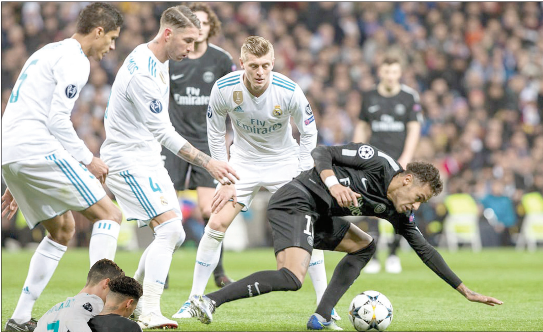
عدد قليل من المراوغات التي قام بها نيمار كان مفيدا لفريقه