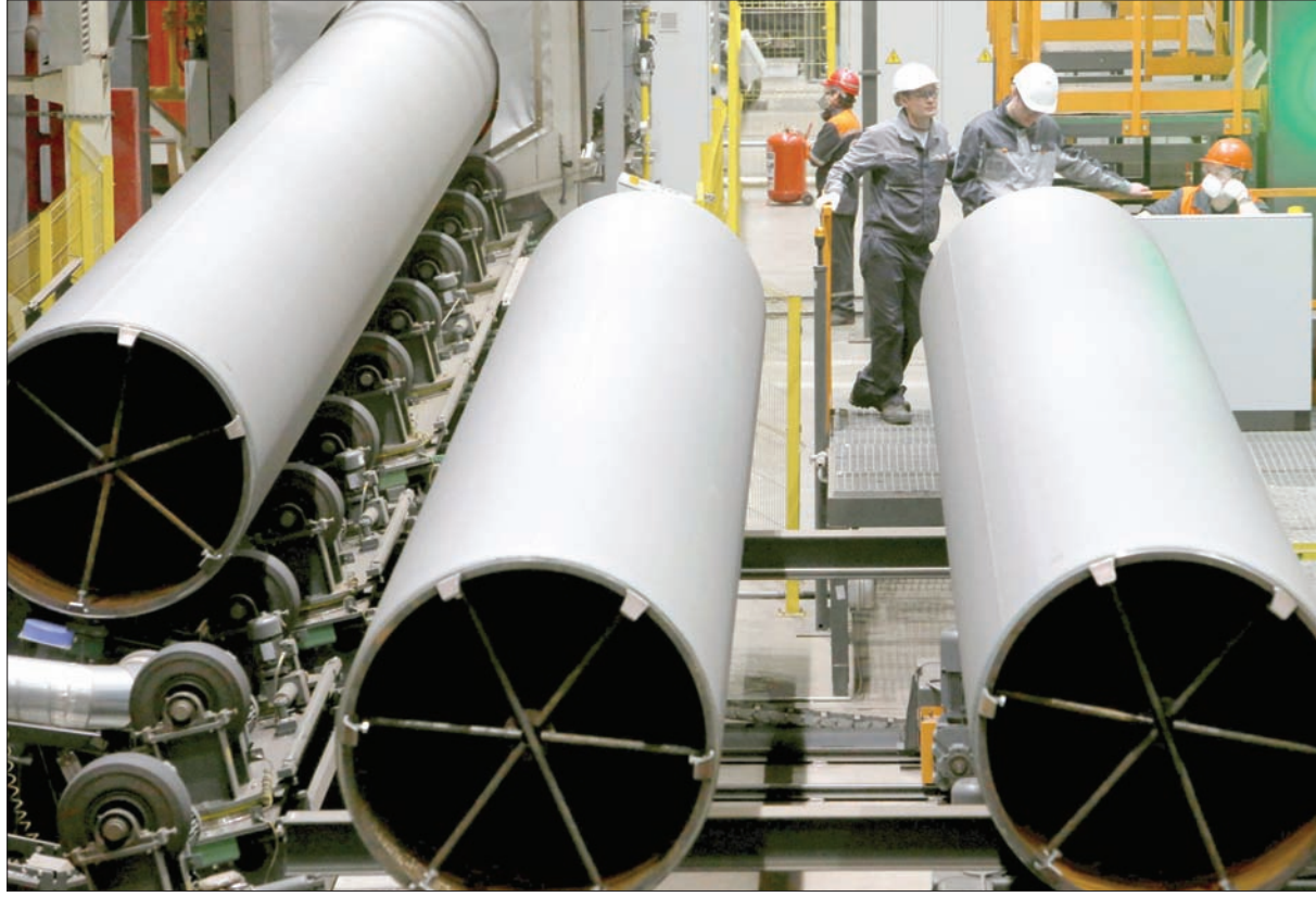
صورة من مصنع زاجورسك الذي يغازي شركة جازبروم الروسية بالأنابيب

وبالعودة إلى «بي إم دبليو»، فقد ارتفعت مبيعاتها منذ مطلع العام الحالي بنسبة 16,6 في المائة، وبينما لم تتجاوز مبيعاتها من مختلف الموديلات 1758 سيارة في يناير 2017، ارتفع الرقم في يناير الماضي حتى 2050 سيارة. وكانت «بي إم دبليو» قد حسنت مبيعاتها في ديسمبر 2016 بنسبة 9,6 في المائة، مقارنة بالمبيعات في ديسمبر 2015، ما يدفع للاعتقاد بأن سوق السيارات الروسية تستعد عافيتها تدريجياً.