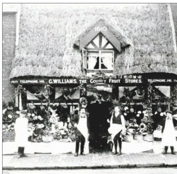
محل البقالة قديماً