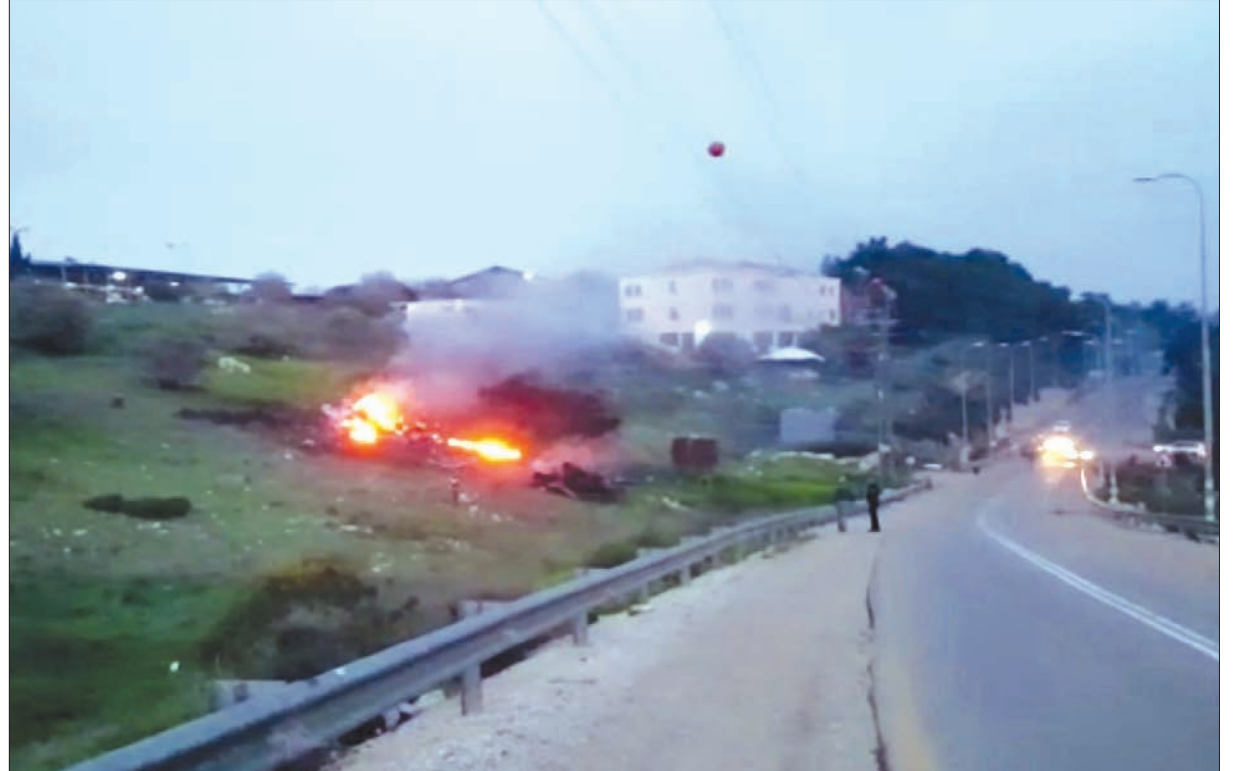
حطام طائرة «إف-16» شمال إسرائيل

وأصاب أكثر من 12 موقعا عسكريا في سوريا، ودمرت طائرة من دون طيار توغلت في أجوائها. وقالت إسرائيل إن «إف 16» سقطت في شمال إسرائيل أصيب بصاروخ سوري مضاد للطائرات. وأعلن الجيش الإسرائيلي، أن المقاتلة سقطت في منطقة وادي جزير شرق مدينة حيفا، وأصيب