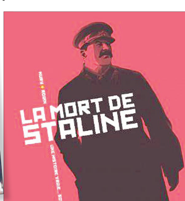
ملصق فيلم «موت ستالين»

إلا أن المزاجية في أوساط أخرى بعيدة عن عالم السياسة، وعالم «النخب» القربة من الدولة، كانت مغايرة تماماً. وأكد أرماندو يانوتشي، مخرج الفيلم، أن «كل قلوب من يدافعون عنه، واعتقدت أن هؤلاء دون قلوب»، وانتقدت قرار وزارة الثقافة، وقالت: إنه يمثل انتهاكاً لاشتهار الروسي الذي يمنع الرقابة. وضم ياكوف جوغاشفيلي، ابن حفيد ستالين صوته لمعارض بالمشروع، وقال إن القائمين على إنتاج الفيلم «لا يمكن وصفهم بأنهم بشر، وكيف يمكن وصف أشياء البشر الذين يجدون في الموت مدعاة للسخرية، على أنهم بشر».