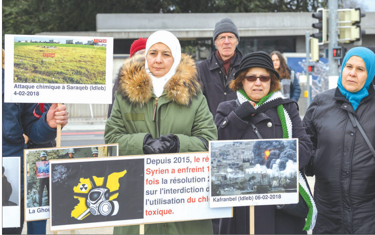
سوريون في جنيف يطالبون بوقف قصف غوطة دمشق أمس

مدينة إدلب، تبين أنه ناجم عن تفجير عبوة ناسفة قرب دوار الساعة وسط المدينة، من قبل مسلحين مجهولين»، لافتاً إلى «مقتل 7 أشخاص على الأقل وإصابة أكثر من 26 آخرين بجراح متفاوتة الخطورة». ونقلت إلى ذلك، قتل وجرح أكثر من 35 شخصاً أمس بانفجار عبوة ناسفة في وسط مدينة إدلب، في حين تصدت فصائل المعارضة لتقدم عناصر تنظيم داعش بالريف الجنوبي للمحافظة قادمين من ريف حماة الشرقي. ولفت في الساعات الماضية أيضاً، وقف النظام حملته الجوية على مناطق الغوطة في العاصمة دمشق والاستعاضة عنها بعمليات قصف مستخدماً صواريخ أرض - أرض.