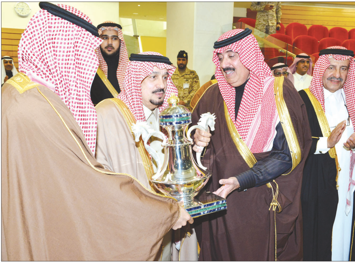
الأمير فيصل بن بندر يسلم الأمير متعب بن عبدالله كأس خيل الإنتاج

وفي ختام الحفل، قال الأمير فيصل بن بندر، في تصريح صحفي: «شرفني سيدي خادم الحرمين الشريفين الملك سلمان بن عبد العزيز، أن أنوب عنه في هذه المناسبة الكبرى، التي تتضمن كؤوساً مقدمة منه، منها ما هو للخيلة المتدئين والأشواط الرئيسية لا شك أن هذه المناسبة قمة في العطاء والتنافس الشريف، بدوري أهني الإخوة الفائزين وأتمنى لأخريين انتصارات قادمة»، مشيداً بالخيلة السعودية المتمرّنين ومستوى الثقافة العالي التي يملكونها مشيراً إلى أنها بصمة للنادي الذي يحتضن مثل هذه الكفائف ويبرزها.