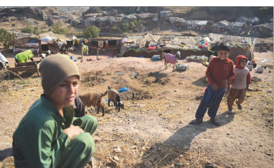
أطفال أفغان خارج منزلهم في مخيم عشوائي على تخوم إسلام آباد حيث يعيش عشرات آلاف الأفغان في منازل من طين وسط فقر مدقع دون مياه وكهرباء.