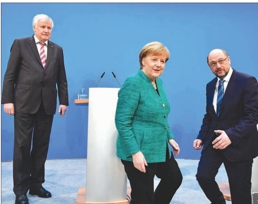
ميركل تتوسط زعيمة حزبي الائتلاف الكبير

الاتحاد الأوروبي إذا لم تتراجع عن إصلاحاتها القضائية المثيرة للجدل. وقد حرصت ميركل