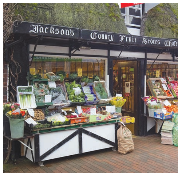
... وبعد 130 سنة

قال علماء من إدارة الطيران والفضاء الأميركية (ناسا) إن كويكباً اكتشف في الأونة الأخيرة مر على مسافة 64 ألف كيلومتر من الأرض، يوم الجمعة، ليصبح ثاني صخرة فضائية تمر داخل مدار القمر خلال أسبوع. وقال بول تشوداس مدير مركز دراسات الأجسام القريبة من الأرض في مختبر الدفع النفاث «ناسا» في باسادينا بكاليفورنيا، إن مسار الكويكب، الذي يتراوح حجمه بين 15 و40 متراً، جعله يمر قرب الأرض بسلام دون أي فرصة لحدوث تصادم. وقال تشوداس في بيان إن الكويكب، الذي يطلق عليه «2018 - سي.بي»، وصل عند أقرب نقطة من الأرض في نحو الساعة 2230 بتوقيت غرينتش، في مدى أقل من خمس المسافة إلى القمر التي تبلغ 386 ألف كيلومتر تقريباً. وأضاف: «الكويكبات من هذا الحجم لا تقترب غالباً إلى هذه المسافة من كوكبنا... ربما تمر مرة أو مرتين في السنة». ورغم أن الكويكب «2018 - سي.بي» يعتبر صغيراً نسبياً من الناحية الفلكية، فقد يكون أكبر من نيزك دخل الغلاف الجوي، وانفجر إلى أجزاء فوق تشيليابينسك في روسيا عام 2013، وأرسل موجة تصادمية حطمت النوافذ، وأدت إلى حدوث أضرار بيمبان وإصابة 1200 شخص. ويوم الثلاثاء، مر كويكب آخر يتراوح حجمه بين 15 و30 متراً على بعد 184 ألف كيلومتر من كوكب الأرض. وذكرت «ناسا» أن علماء الفلك بمركز كاتالينا سكاى، الذي تموله بالقرب من توسان بولاية أريزونا، اكتشفوا الكويكبين خلال هذا الشهر.