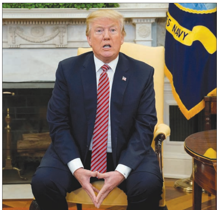
الرئيس ترمب خلال لقاء صحفي في المكتب البيضاوي الجمعة (رويترز)

للصحيفة إنهم لم يسعوا للحصول على المعلومات بشأن ترمب من هذا الروسي الذي يشتبه في أن له صلات بالمخابرات الروسية ومسئولين إلكترونيين في شرق أوروبا. ونقلت الصحيفة عن المسؤولين قولهم إن الرجل ادعى أن المعلومات تربط الرئيس ومساعديه بروسيما. وأضافوا أنه بدلاً من أن يسلم أدوات التسلل الإلكتروني، قدم مادة مشكوكا في صحتها، وقد تكون مفبركة عن ترمب وأخرين ضمنتم سجلات بنوك ورسائل إلكترونية وبيانات زعم أنها من المخابرات الروسية. وقالت الصحيفة إن الوثائق الإلكترونية امتنعت عن التعليق بشأن المفاوضات مع هذا الروسي. ونقلت الصحيفة عن وكالة الأمن القومي: «كل موظفي وكالة الأمن القومي ملتزمون بالزاماً أدياً بحماية المعلومات السرية». ولم ترد وكالة المخابرات المركزية على طلب من «رويترز» للتعليق، بينما لم يتسنّ التواصل مع مسؤولي وكالة الأمن القومي الذين كانوا وقت الاتصال بهم خارج أوقات العمل الرسمية.