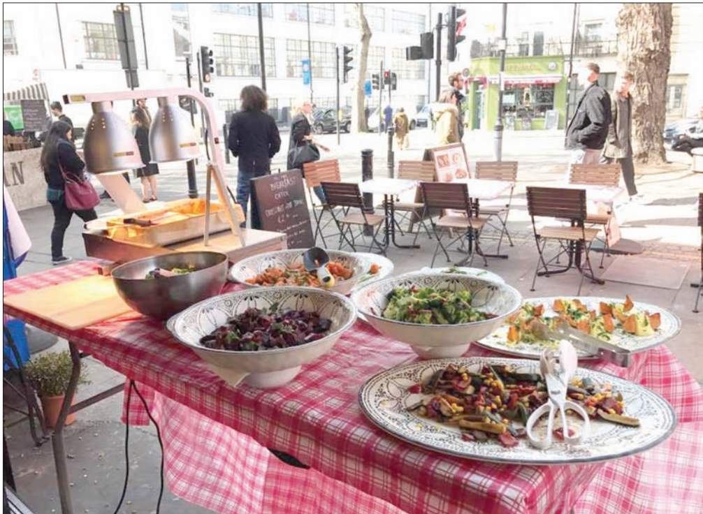
تقدم سوق «إكسموث ماركت» العديد من المخابز بقالب عصري وجذاب

الأكلات الشعبية مرغوب فيها ولم تعد رخيصة كما في السابق