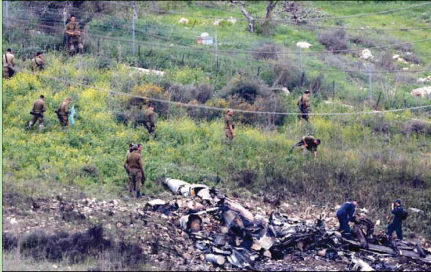
تل أبيب: نظير مجلي موسكو: رائد جبر لندن - بيروت، الشرق الأوسط،

أعلنت إسرائيل أمس شن ضربات واسعة النطاق استهدفت مواقع «إيرانية» في عمق الأراضي السورية، بعد إسقاط إحدى مقاتلاتها من طراز «إف 16»، في تجاوز للخطوط الحمراء في سوريا الروسية، التي كان يعتقد أنها خاضعة لقواعد اشتباك محددة فرضها الوجود العسكري المباشر لروسيا منذ نهاية 2015.