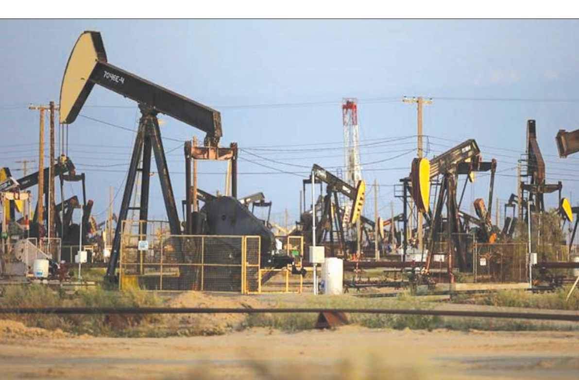
منصات حفر في حقل نفط أميركي

استمر عامين. وبلغ إجمالي عدد حفارات النفط والغاز الطبيعي النشطة حتى التاسع من فبراير (شباط) 975 حفاراً، وهو أيضاً أعلى مستوى منذ أبريل (نيسان) 2015، مقارنة مع متوسط بلغ 876 حفاراً في 2017 و509 حفارات في 2016، ونحو 978 حفاراً في 2015، وتنتج معظم هذه الحفارات كلاً من النفط والغاز. واخذ النفط الأمريكي نحو العام ونصف العام، للهبوط من 106 دولارات، ليلبغ القاع عند 26 دولاراً في يناير (كانون الثاني) 2016. لكنه احتاج إلى عامين ليرتفع من مستوى القاع إلى 66 دولاراً، ومنذ منتصف 2016، زاد إنتاجه بأكثر من 17 في المائة، ليسجل 9,88 مليون برميل يومياً. وبفعل تجدد المخاوف نتيجة ارتفاع إمدادات الخام، انخفضت العقود الآجلة للخام الأمريكي وخام برنت أكثر من 11 في المائة من مستوى ذروة العام الحالي، الذي بلغته في أواخر يناير. ونزل برنت نحو 9 في المائة خلال الأسبوع الماضي، بينما هبط الخام الأمريكي 10 في المائة، في أكبر خسائر أسبوعية منذ يناير 2016. وسجلت العقود الآجلة سادس خسائرها اليومية على التوالي، لتبديد المكاسب التي حققتها منذ بداية العام في سلسلة من الجلسات التي شهدت أرباح تداول مرتفعة تحت ضغط من بيانات أقوى من المتوقع عن الإمدادات، وارتفاع غير متوقع في كميات الخام من مستودعاته عبر خط أنابيب فورتيس في بحر الشمال، الذي أغلق في وقت آخر 2016 حين بدأت أسعار الخام في التعافي من هبوط حاد