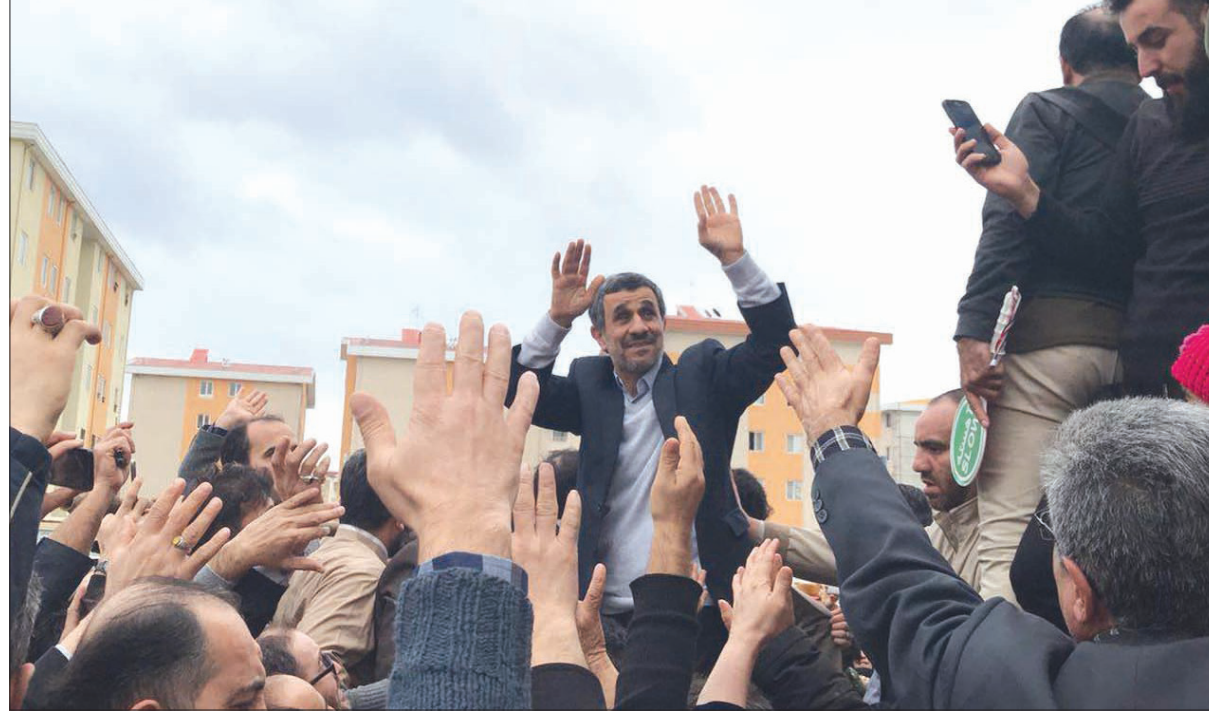
الرئيس الإيراني السابق محمود أحمدي نجاد بين أنصاره في مدينة رشت شمال إيران أول من أمس

وأضاف بقايي: «هل انتهى تاريخ استهلاك البعض ومن المقرر أن تحدث تصفيات قريبة في الحرس الثوري وتحت هذه المسؤولية يجب أن تكون ضحية الخلافات الداخلية في الحرس الثوري».