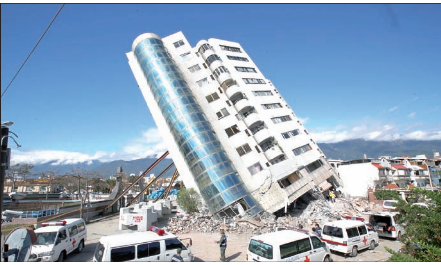
العمارة المائلة التي عثر بها على 3 جثث لأفراد من أسرة صينية كانت في زيارة لتايوان