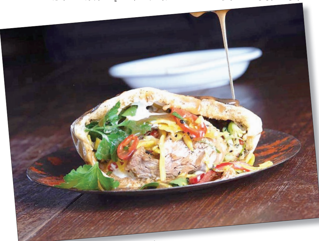
الأطباق الشرقية لها وجودها دائماً في أسواق الطعام بلندن

ولمحببي الأكلات اللاتينية والإسبانية أيضاً هناك منوعات الد«بينشو بينتسوس» التي عادةً ما تكون قطعاً من الخبز مع بعض أنواع اللحوم وخصوصاً الدجاج المشوي. وبالطبع يمكن اللجوء إلى شرائح «البان كيك» الفرنسية الرقيقة المعروف بال«كريب». وعادةً ما تحضر الرقائق من الحليب والدقيق والبيض والزيت والملح وتقلي على مقلاة ساخنة. أضف إلى كل هذا التنوع خيارات قطع «سيميبل تاي» التايلاندية الرخيصة التي تشمل شتى أنواع الشوربات والسلطات الحارة وشتى أنواع الكاري بالكريم وجوز الهند وغيره.