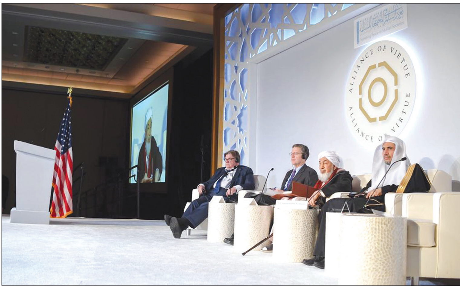
جانب من مؤتمر تحالف الأديان الذي عقد في واشنطن

نتيجة من ضعف استيعاب سنة الخالق في الاختلاف والتنوع. وأكد أن الصراع الديني والفكري وما ينتج عنه من تطرف وتطرف مضاد لا يتحمل مسؤوليته المخططون فكريا وحدهم؛ وإنما يتحمله أيضا من وضع أرضية تلك الصراعات والصداعات، وأسس لنظريات الكرم والهدوء والدعاء لكل مخالف له في الدين والفكر والثقافة. وأشار إلى أن الأفكار الواجبة تحترم حق غيرها في الوجود والعيش بكرامة، وزاد في كلمة له في المؤتمر بأن «كل عنف باسم الدين يوجد خلفه تقاعس