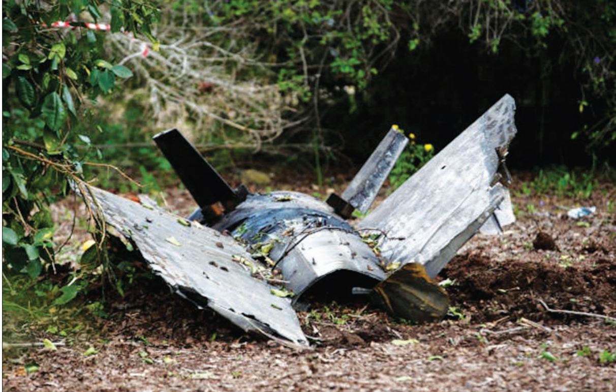
بقايا صاروخ أرض - جو سوري في منطقة قريبة من موقع سقوط الطائرة الإسرائيلية أمس