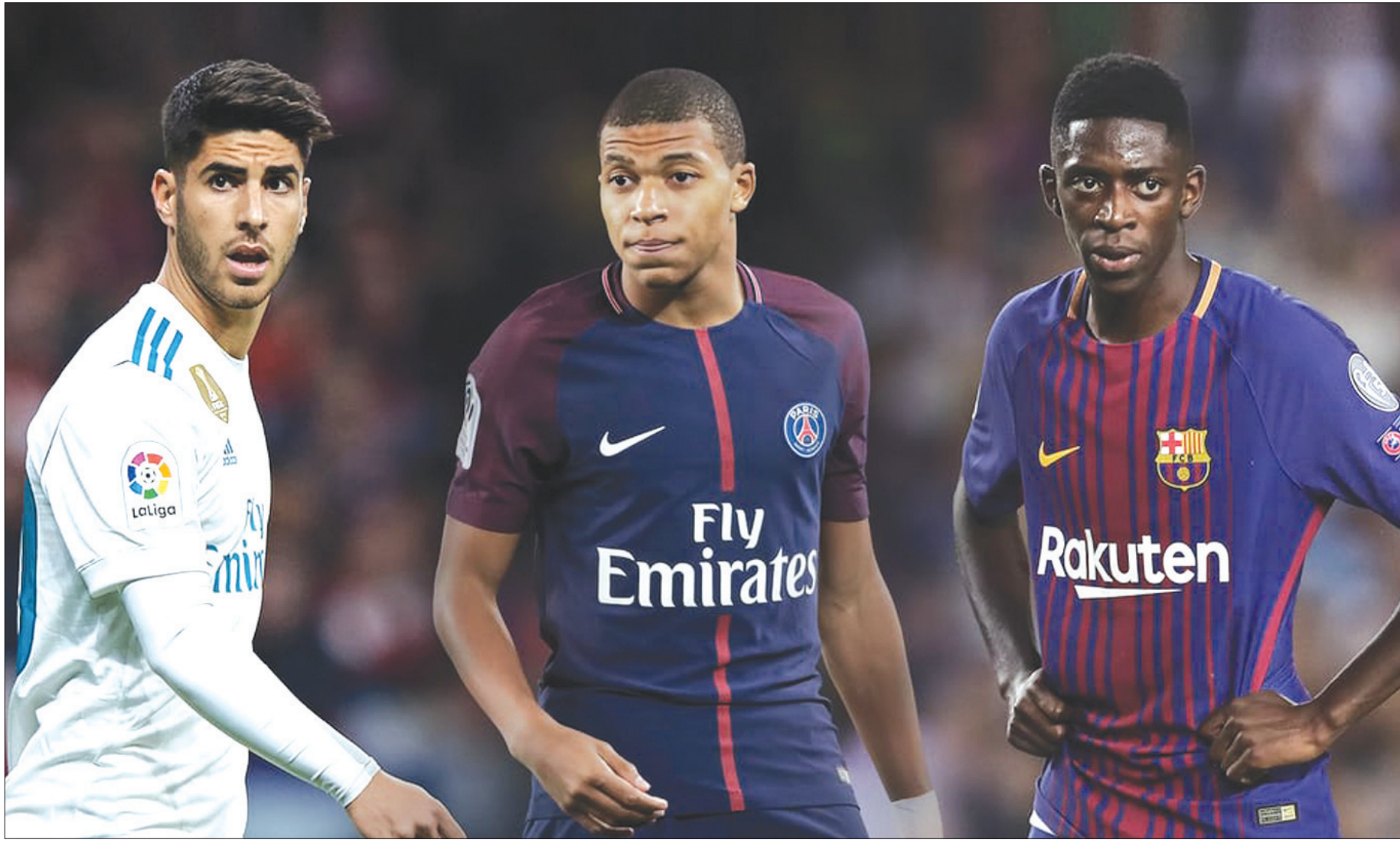
عثمان ديمبلي - كيليان مبابي - ماركو أسينسيو

وفي أكتوبر (تشرين الأول) الماضي، استدعى بروسيا دورتموند لاعبه الشاب من بطولة كأس العالم تحت 17 عاماً، التي كان يشارك فيها مع المنتخب الإنجليزي وسجل خلالها ثلاثة أهداف في دور المجموعات، وبالتالي حرمه من الفوز بمونديال الشباب مع منتخب بلاده. ومنذ ذلك عام الصيف الماضي، ورغم حصول أسينسيو على العديد من الفرص خلال الموسم الحالي مع ريال مدريد، وهو ما يثير بعض الشكوك حول قدرة اللاعب على حجز مكان له في قائمة المنتخب الإسباني المشاركة في نهائيات كأس العالم القادمة بروسيا.