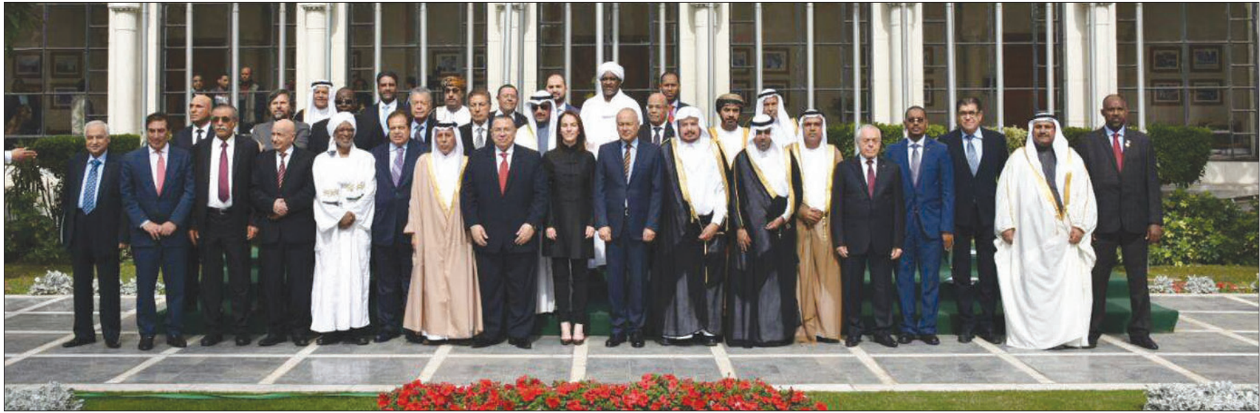
القاهرة، «الشرق الأوسط»

طالب رؤساء المجالس والبرلمانات العربية بقطع جميع العلاقات مع أي دولة تعترف بالقدس عاصمة لإسرائيل، أو تنقل سفارتها إليها، ووجوب وقف جامعة الدول العربية بحزم أمام بعض الدول التي خالفت قرارات الشرعية الدولية بعدم تصويتها لصالح قرار الجمعية العامة للأمم المتحدة الخاص بالقدس في ديسمبر (كانون الأول) الماضي.