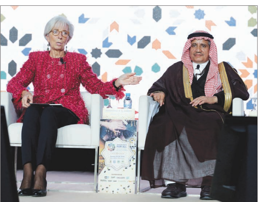
كريستين لاغارد مديرة صندوق النقد الدولي وعبد الرحمن الحامدي مدير صندوق النقد العربي في مراسم الشهر الماضي

مضيفاً أن نصف عدد السكان في الدول العربية البالغ 400 مليون نسمة هم دون 25 من العمر. وشددت لاغارد على أهمية تطبيق إصلاحات صارمة ومعدل نمو أعلى، من أجل خلق وظائف للشباب العرب. وقالت إن «البطالة بين الشباب هي الأعلى في العالم... معدلها 25 في المائة، وتعدى 30 في المائة في 9 دول»، مضيفة: «أكثر من 27 مليون شاب طامح سينضمون إلى سوق العمل في السنوات الخمس المقبلة». وكانت لاغارد قد أقرت في حوار لـ«الشرق الأوسط» 29 يناير (كانون الثاني) الماضي، أن التحدي الراهن أمام الدول العربية هو خفض الدين العام، وطالبت بخفضه بطريقة لا تخل بمعايير التوازن والعدالة. وقالت لاغارد: «توجد في بلدان المنطقة نسب دين من أعلى النسب على مستوى العالم. وقد بذلت الحكومات جهوداً