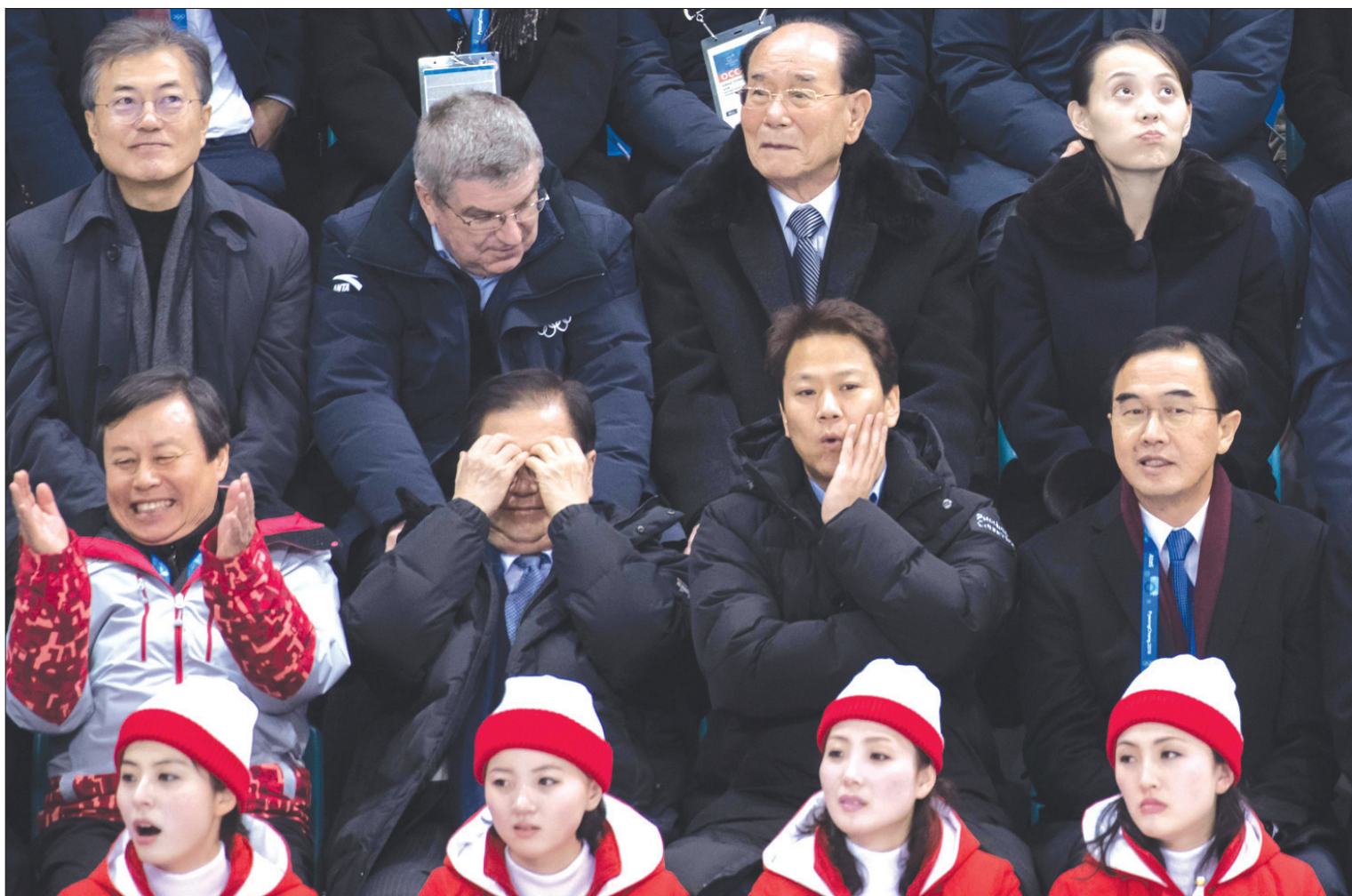
من أعلى الصورة - من اليسار إلى اليمين: الرئيس الكوري الجنوبي مون جاي- إن ورئيس اللجنة الأولمبية توماس باخ وكيم يونغ نام الرئيس الفخري لكوريا الشمالية وكيم يو بيونغ شقيقة الزعيم الكوري الشمالي، خلال مشاهدتهم مباراة للعبة الهوكي النسائية (أ.ف.ب)

سيول، «الشرق الأوسط» هذا الأمر منذ عام 2014.