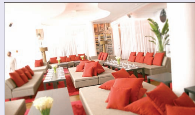
مطعم «لا كانتين دو فوبور» يديكره الجميل

فرصة الفون بخاتم الماس في «لا كانتين دو فوبور» يوم عيد الحب