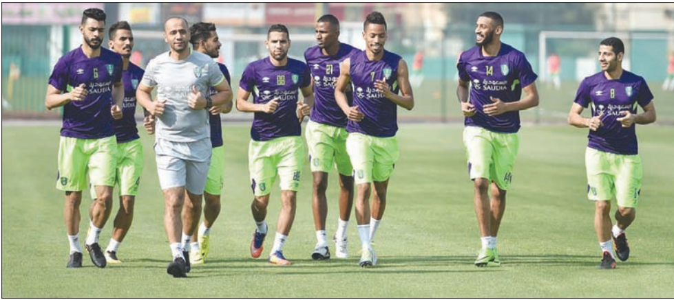
لاعبو الأهلي في تدريباتهم الأخيرة استعداداً للمواجهة الآسيوية «الشرق الأوسط»

وتعتبر الحصة التدريبية التي أجراها فريق الأهلي أمس على ملعبه، وقبل مغادرته مسقط هي الحصة التدريبية الرئيسية له، تحضيراً للقاء الآسيوي لضيق الوقت الفاصل بين المباريات، بينما ينتظر أن يقف مدرب الفريق على القائمة الأساسية التي سيديع بها في لقاء الغد، من خلال تدريب اليوم الذي سيجريه في العاصمة