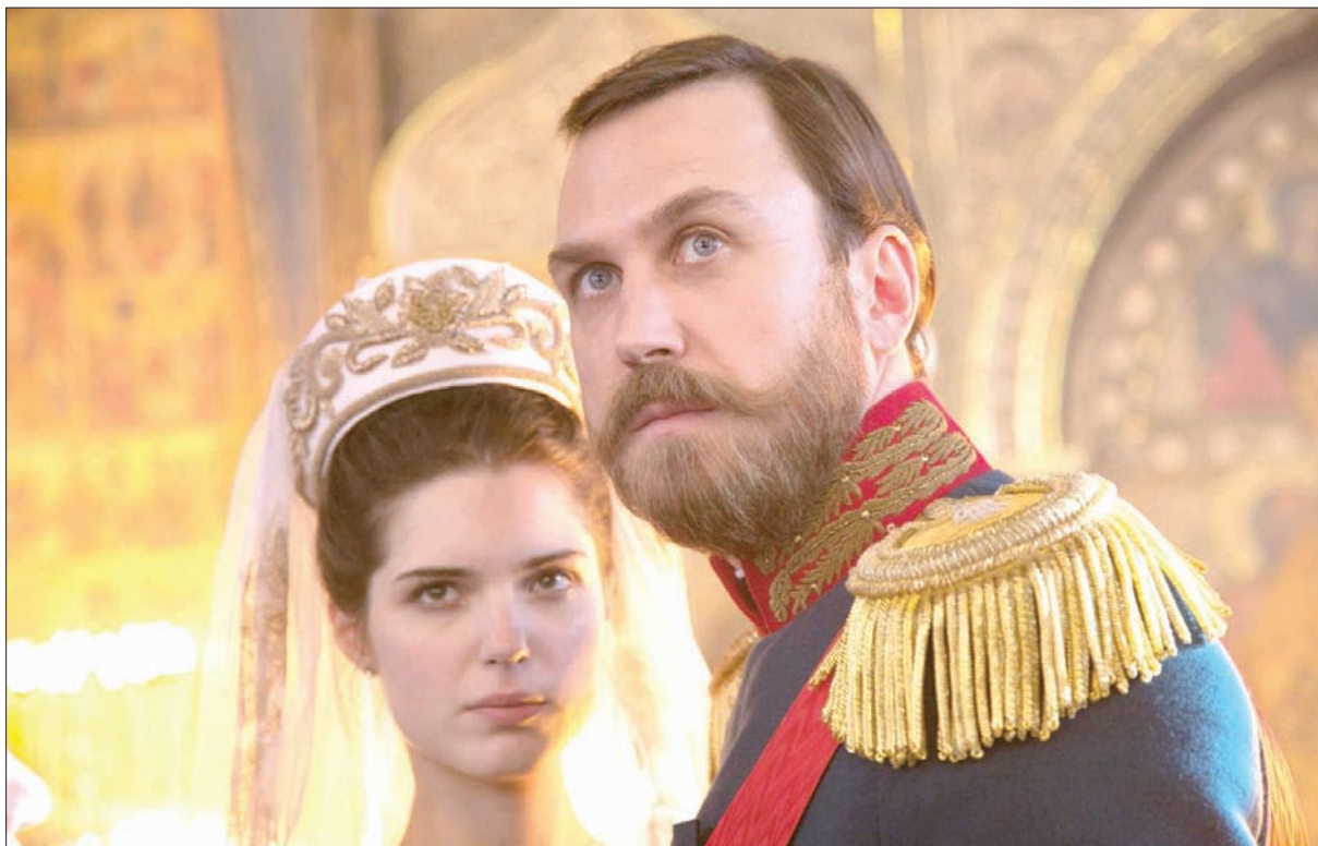
أحد مشاهد فيلم «موت ستالين»