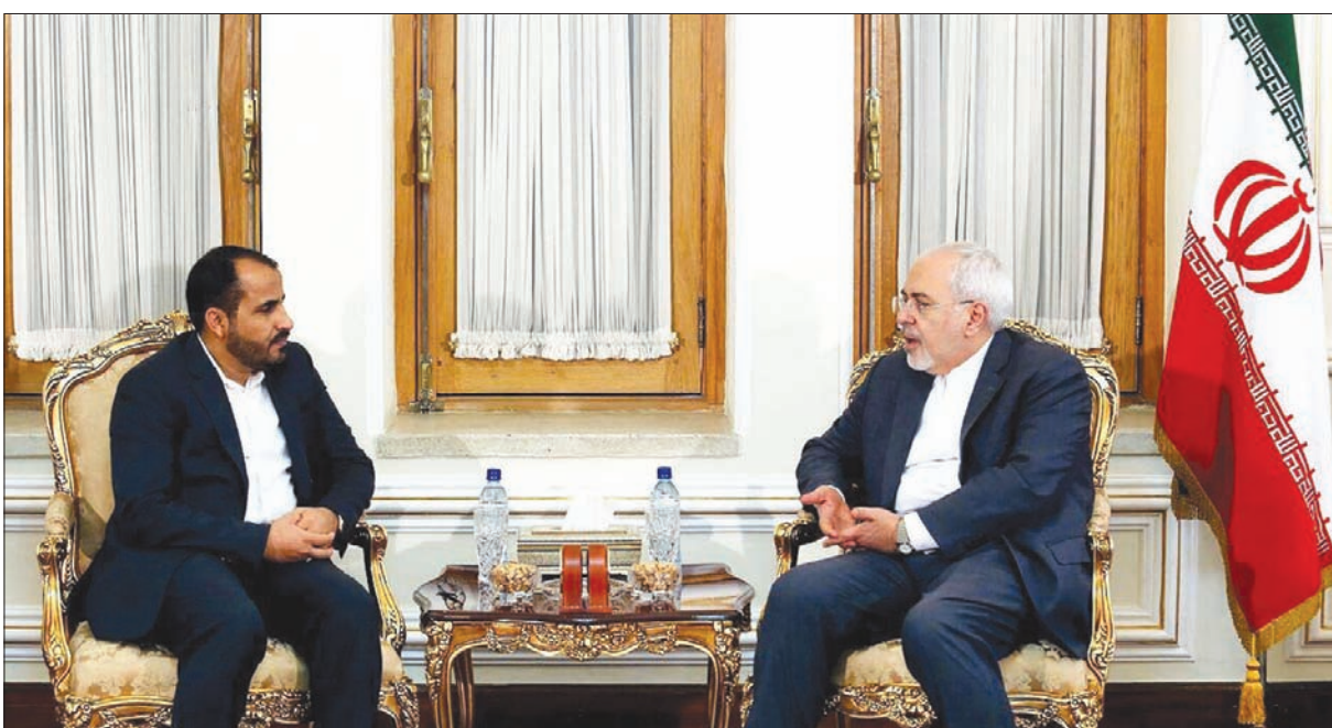
طريف لدى لقائه عبد السلام في طهران أمس

خلال 3 سنوات من الانقلاب على الشرعية، لتضمن بقاء نفوذها في خاضعة المحيط العربي، واستغلال الميليشيات التي تآمر بأمرها لإطلاق الجوارح اليمن، وتهديد الملاحة الدولية في البحر الأحمر. وبحسب التقارير الأممية الأخيرة، فإن إيران لا تزال مستمرة في تهريب السلاح إلى اليمن لصالح ميليشيا الحوثي، وبخاصة ما يتعلق بالصواريخ الباليستية والطائرات المسيرة، إضافة إلى ما تقوم به على الأرض من إسناد لانقلابيين بالدعم المالي واللوجستي وتوفير الخبراء العسكريين لتولي تدريب الميليشيات. وكشفت خفايا الجولات السابقة من مفاوضات السلام التي رعتها الأمم المتحدة في سويسرا والكويت بين الحكومة الشرعية والانقلابيين الحوثيين استعداد الجماعة المالية لإيران للقبول باتفاق سياسي شكلي فقط يضمن شراكتها في السلطة الخوافية، لكنها لم تد أي نوايا جدية للتخلي عن قوتها العسكرية وتسليم مخزونها الكبير من الأسلحة التي نهبتها من معسكرات الجيش اليمني. ويعني التوصل لأي اتفاق مستقبلي مع الحوثيين يستجيب للشروط الإيرانية،