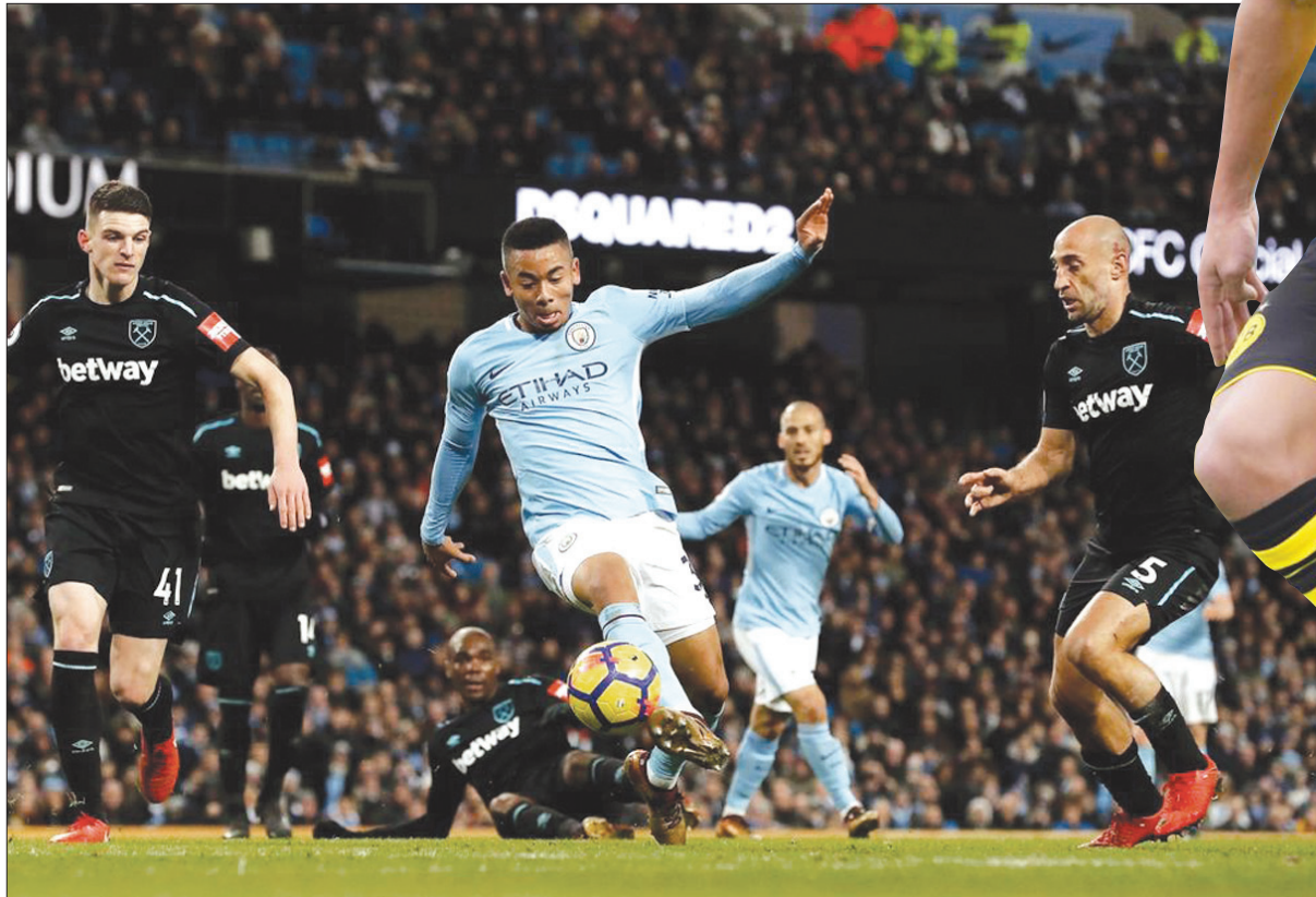
غابرييل جيسوس تألق مع مانشستر سيتي

ويتوقع أن يلعب جيسوس دوراً هاماً مع منتخب بلاده في نهائيات كأس العالم القادمة بروسيا. وربما يشهد كأس العالم أيضاً وجود اللاعب البرازيلي الشاب فينيسوس جونيور البالغ من العمر 17 عاماً، الذي انتقل الموسم الماضي لنادي ريال مدريد مقابل 38 مليون جنيه إسترليني قبل أن تختم إعارته لنادي ان ينتقل اللاعب الشاب للعب في الدوري الإسباني قبل نهاية العام الحالي، لكن يعد أحد الأسماء التي تستحق المتابعة بكل تأكيد.