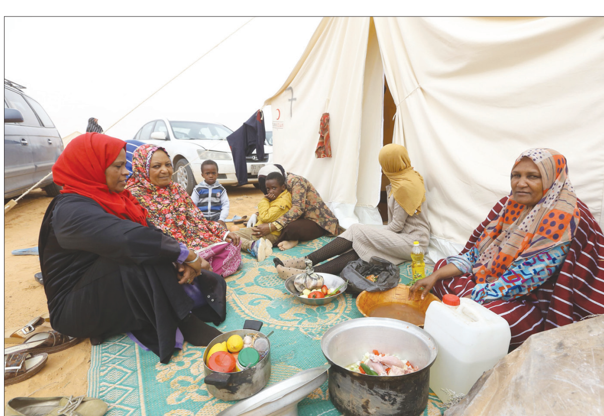
نازحون من مدينة تاورغاء الليبية خارج مخيمهم العشوائي المؤقت إثر منعهم من العودة إلى ديارهم في اللحظة الأخيرة

الإرهاب». كما أدانت السفارة الأميركية في ليبيا في بيان لها التفجير، قبل أن تشير إلى أن بنغازي قد «تعرضت خلال الأسابيع القليلة الماضية إلى هجمات مماثلة». من جانبه، قال المجلس الرئاسي لحكومة الوفاق الوطني في بيان له: «إن هذه الأعمال الإرهابية التي تحترق في مدينة بنغازي، تتخفى تماماً وتعاليم الدين الحنيف، وتتعارض مع القيم والبيدات الإنسانية، معتبراً أن هذه الجرائم تتطلب استنفار القوى الأمنية كافة في ليبيا للعمل المشترك على مواجهتها». وبعدما دعا إلى «توحيد الصف والجهود لمواجهة الإرهاب وفلوله، وجميع العابثين بامن واستقرار الوطن وتقديم الجناة للعدالة»، لفت إلى أن الحكومة ستتكفل بعلاج جرحى هذا العمل الإرهابي داخل ليبيا وخارجها. في شأن آخر، أعلنت غرفة عمليات سرت الحربية عن إصابة ثلاثين من عناصرها وحرق سيارتين، بعدما استهدفت سيارة مفخخة استيقاف للكتيبة 165 التابعة للغرفة في بوابة التسعين شرق مدينة سرت. من جهة ثانية، كشف رئيس اتحاد يهود ليبيا، رفائيل لوزون، النقاب عن إجراءات الاتصالات مع السلطات الليبية في العاصمة طرابلس، بما في ذلك أحمد معيتيق، نائب رئيس حكومة الوفاق، بالإضافة إلى عبد الرحمن السويحلي، رئيس المجلس الأعلى للدولة، وأوضح في تصريح تلفزيوني، مساء أول من أمس، أنه على تواصل مع معيتيق، الذي قال إنه طلب منه أن يكون حلقة الوصل مع الجالية اليهودية الليبية في بنغازي، وقال: «تعازينا الحارة لأهالي الضحايا... وبريطانيا نقف صفاً واحداً مع الليبيين في مكافحة