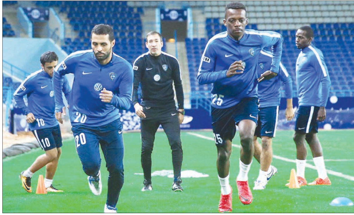
لاعبو الهلال خلال تدريباتهم على ملعب جامعة الملك سعود