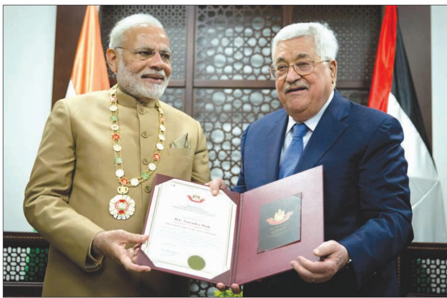
الرئيس عباس يمنح رئيس الوزراء الهندي «القلادة الكبرى لدولة فلسطين» خلال زيارته إلى رام الله أمس

موضاً أن «دائرة العنف وعبء التاريخ يمكن التغلب عليهما من خلال الدبلوماسية المكثفة»، وقال بهذا الخصوص إن دعم القضية الفلسطينية «أصبح محورا ثابتا في سياستنا الخارجية، وأنا سعيد بالاجتماع مع الرئيس عباس، الذي استقبلته الحكومة الهنديّة في نيودلهي، ويسعدني أن نجد صداقتنا ونجد دعم الهندي». ووعت الحكومتان الهنديّة والفلسطينية بحضور عباس ومودي أربع اتفاقيات بقيمة 41,35 مليون دولار. ووقع الاتفاقية الأولى وزير الصحة جواد عواد المشرف العام على الإعلام الرسمي أحمد عساف مع سكرتير الدولة للعلاقات الاقتصادية في إس تيروموتي، تتعلق بإنشاء مستشفى متعدد الأغراض في بيت ساحور، بقيمة 29 مليون دولار. فيما وقع الاتفاقية الثانية وزير التربية والتعليم العالي صبري صيدم، في حين وقع الاتفاقية الرابعة وزيرة الاقتصاد الوطني عير عودة، مع سكرتير الدولة للعلاقات الاقتصادية في إس تيروموتي،