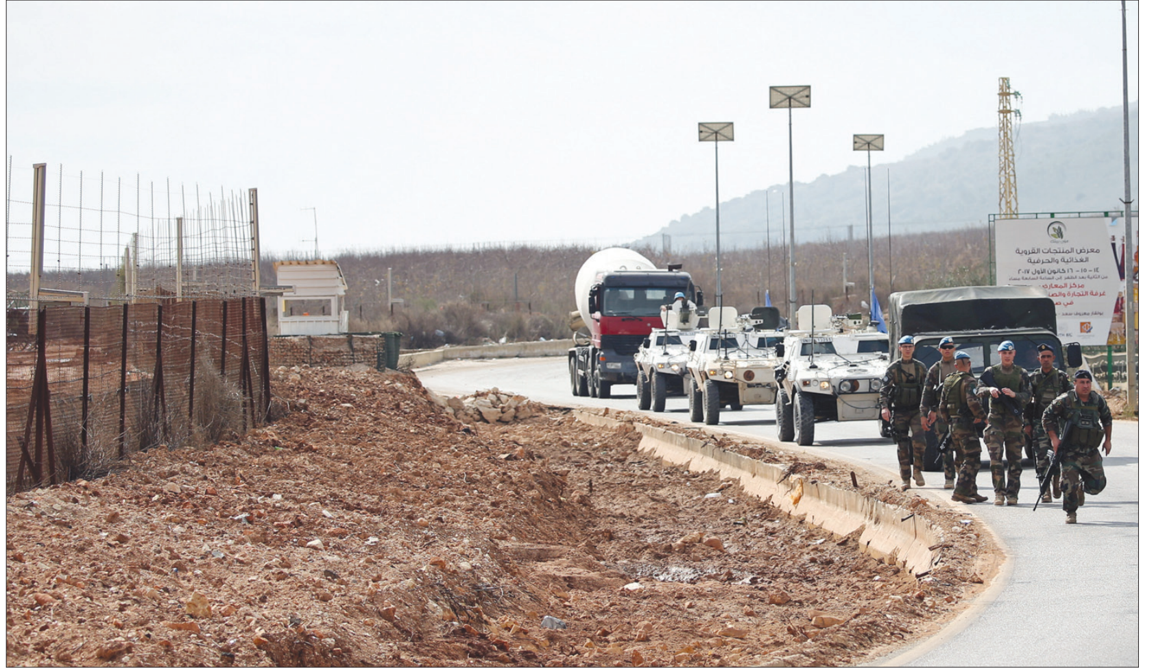
جنود لبنانيون ومن قوات حفظ السلام التابعة للأمم المتحدة (يونيفيل) قرب قرية كفا كلا على الحدود اللبنانية - الإسرائيلية أمس