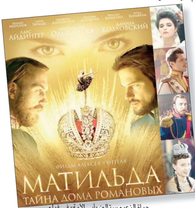
حياة الزعيم ستالين «أبي الأمة» في فيلم

وشرح المعارضون للفيلم موقفهم في رسالة إلى وزير الثقافة، قالوا فيها إن «الفيلم وإلى جانب الأداء السليم جداً للممثلين، والديكور البعيد عن الواقع، فإنه يشهر بتاريخ بلدا، ويشوه ذكرى أبناء بلدا الذين انتصروا على النازية»، فضلاً عن ذلك على أصحاب الرسالة مما قالوا إنها معلومات في الفيلم تبدو قريبة من التطرف، وترمي إلى إهانة كرامة الإنسان الروسي، وتعرض «نظرة مهينة للشعب الوطني». وأضاف أن الفيلم يشكل إهانة «لكل من استشهد في معركة ستالينغراد، ومن بقي هناك على قيد الحياة».