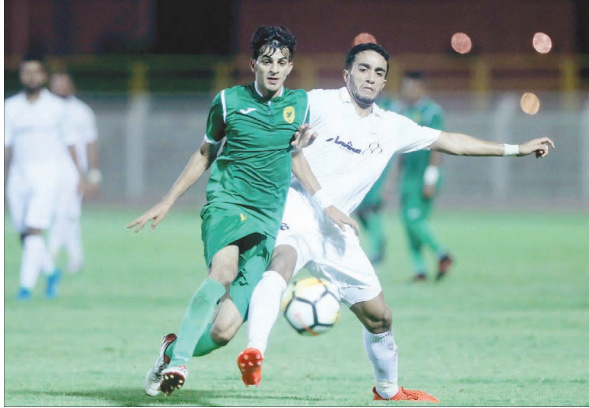
دوري الدرجة الأولى سيكون محط أنظار الجماهير والإعلام بعد تغيير مسماه

وبين العفالق أن المردود المالي على الأندية سيكون كبيراً في المرحلة المقبلة، مع رفع قيمة الرعاية، وإن تمت زيادة عدد الفرق في دوري المحترفين فهذا سيحقق أثراً إيجابياً، خصوصاً أن هناك حاجة ماسة لخوض اللاعبين عدداً أكبر من المباريات حتى تتطور