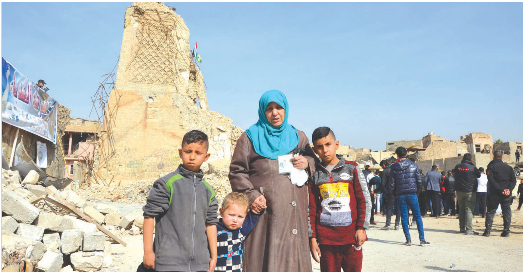
عراقيون يتفقدون أوسقيا بقايا المئذنة الحدياء لجامع الثوري الكبير الذي فجّره «داعش» في الموصل

وفي الكويت قال الدكتور ظفر العجمي، مدير مركز الخليج لدراسات التنمية، إن الكويت في حاجة أن تكون جاراتها العراق مستقرة، لأن استقرار العراق يعد استقرارا للكويت، مشيراً إلى تبعات عدم استقرار العراق من خلال «داعش» وغيرها التي تهدد الأمن في المنطقة.