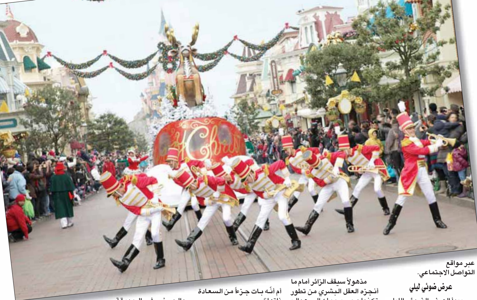
عبر مواقع التواصل الاجتماعي.

مذهولاً ما سيقف الزائر أمام ما أنجزه العقل البشري من تطور تكنولوجي يحمله إلى عوالم مختلفة عن واقعه ليتجدد من الواقع ويظهر سابحاً بصخب الألوان وروعة الموسيقى والأغاني التي تحمله إلى أماكن أبعد من الخيال، باكثر الحفلات إبهاراً لتداعب الخيال. كما أنه يستعصى على النسيان، تعتمد على تكنولوجيا الخرائط الرقمية وتأثيرات خاصة باهرة.