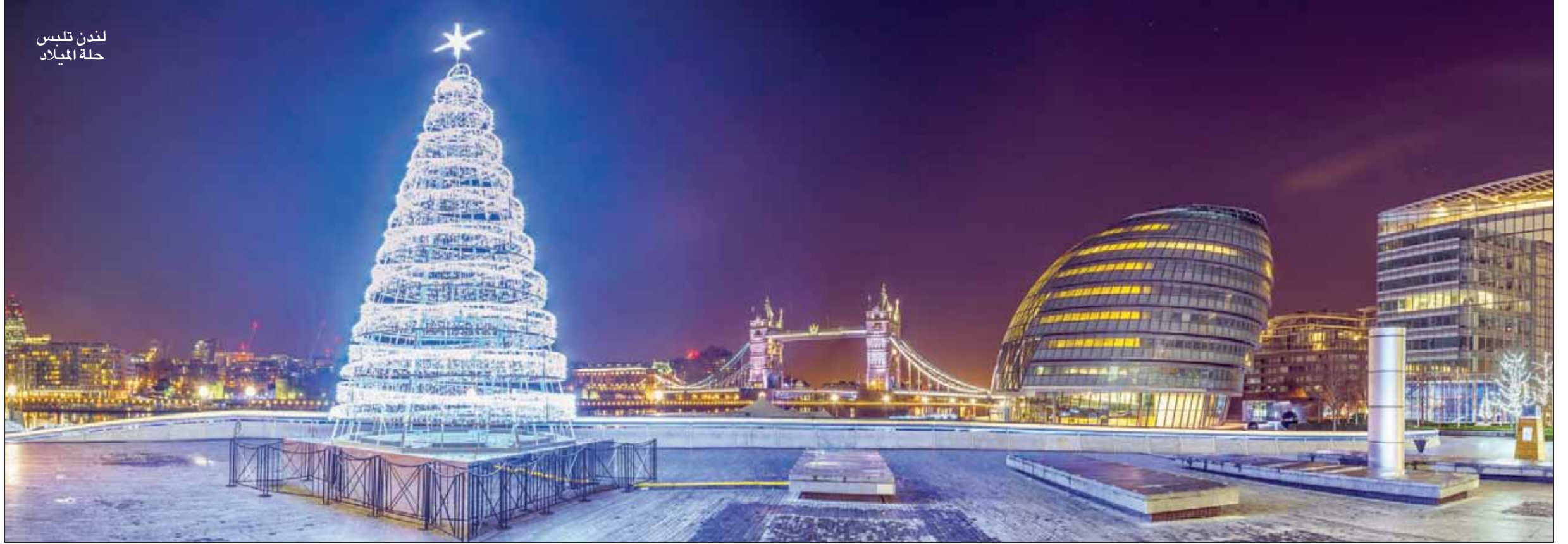
لندن تلبس حلة الميلاد

وتستقبل مسارح لندن بعض المشاهير الذين يقدمون عروضاً خاصة باحتفالات نهاية العام في لندن، ومنها عرض لشخصيات ديزني التي ترقص على الجليد في قاعة «أو 2» شرقي لندن، أو عرض باليه خاص في دار «رويال أوبرا هاوس». وتقدم قاعة «رويال البرت هول» احتفالاً غنائياً خاصاً في موسم الشتاء الحالي، وفي لندن تفتح المتاحف أبوابها مجاناً، وتعمل المطاعم بكل طاقتها خلال فترة الشتاء التي تعتبرها موسم ذروة.