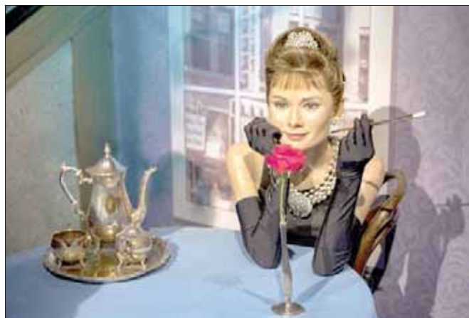
تمثال أودري هيبورن

ونظراً لأن الجولة تشبه جولات مدينة الملاهي، فإنها تحظى بشعبية كبيرة لدى من يشعر بالارهاق من السير والتجول في المعرض، وكذلك لدى الأطفال.