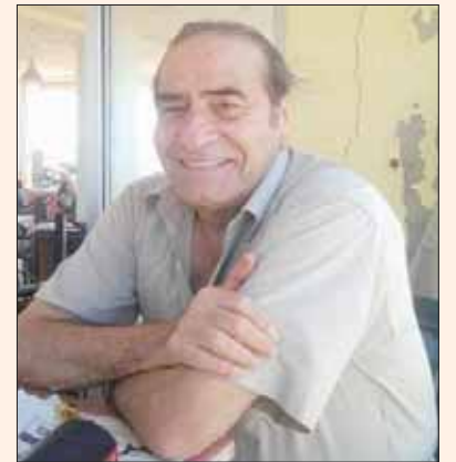
بيروت، «الشرق الأوسط»