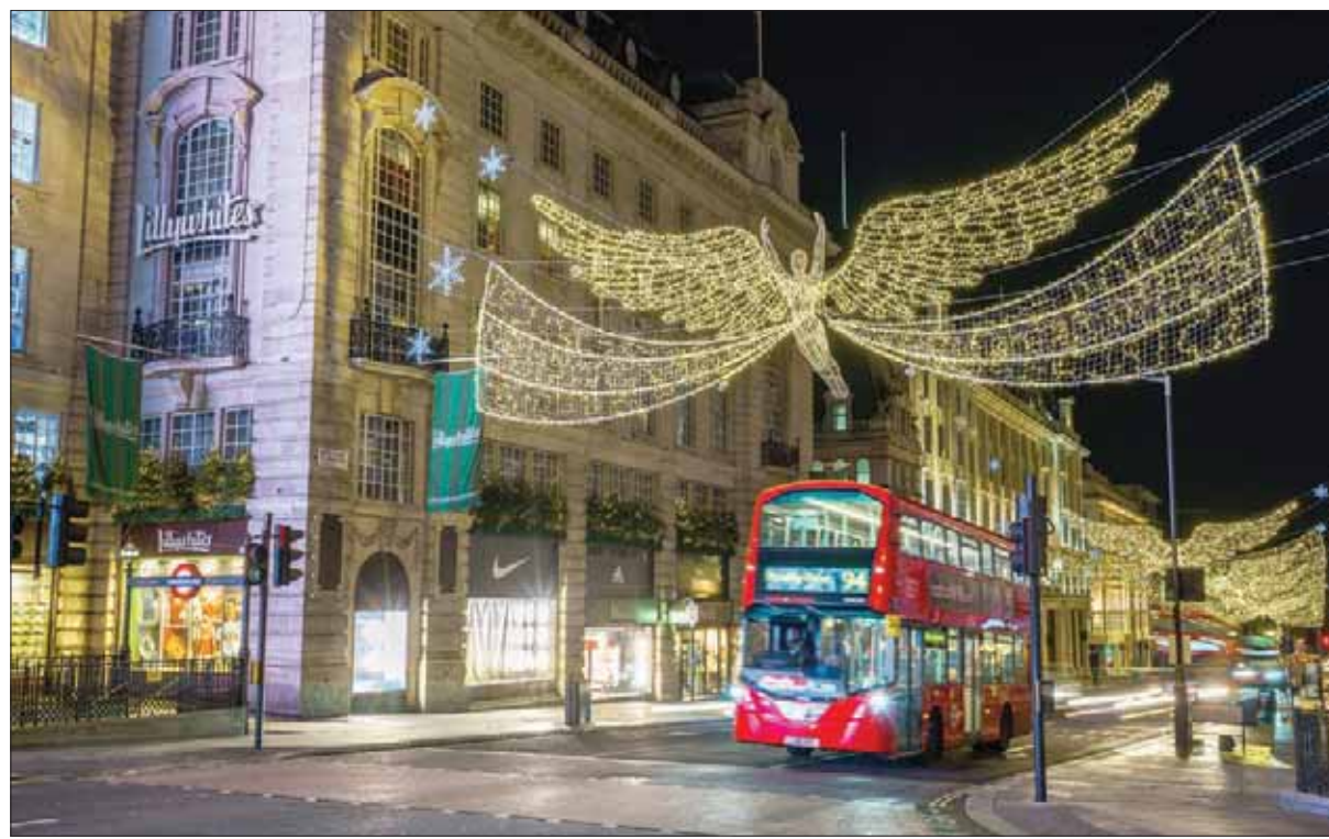
زينة وأضواء في مناطق التسوق

ساحات التزلج على الجليد: تقدم لندن الكثير من ساحات التزلج على الجليد، إحداها تقام على ساحة ساوث بنك، حيث توجد عجلة لندن