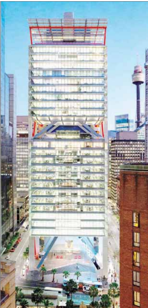
مبنى تشيفلي سكوير بسيدني في أستراليا (بريت بوردمان)

وتضمن الاختيارات التنوع، فإلى جانب المباني الفاخرة هناك المباني المقامة بمبانيات بسيطة في مناطق نامية، أو مناطق تعرضت لكوارث طبيعية. وحسب «ريبا»، فالمرئانية البسيطة لن تقلل من أهمية أو فاعلية المبنى، أو قابليته للتنافس مع تصميمات أغنى وأكثر لمعاناً. بالنظر للمباني المرشحة ومدى التنوع بينها يبدو أن مهمة هيئة التحكيم ليست سهلة، لكن مجرد طرح القائمة الطويلة سيلفت النظر حتماً إلى نماذج من العمارة المتميزة في العالم، ويكون حافزاً بين المعماريين على الإبداع.