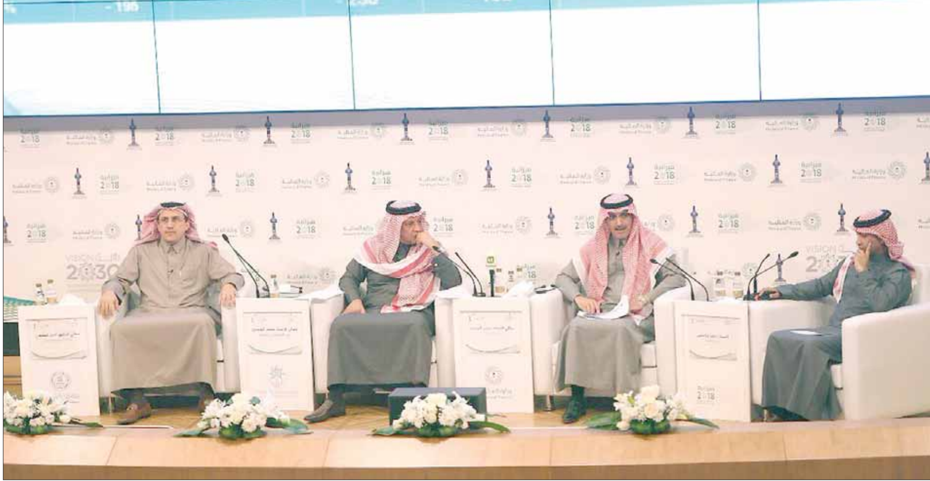
جانبا من المؤتمر الصحافي الذي عقد في الرياض أمس عقب إعلان الميزانية