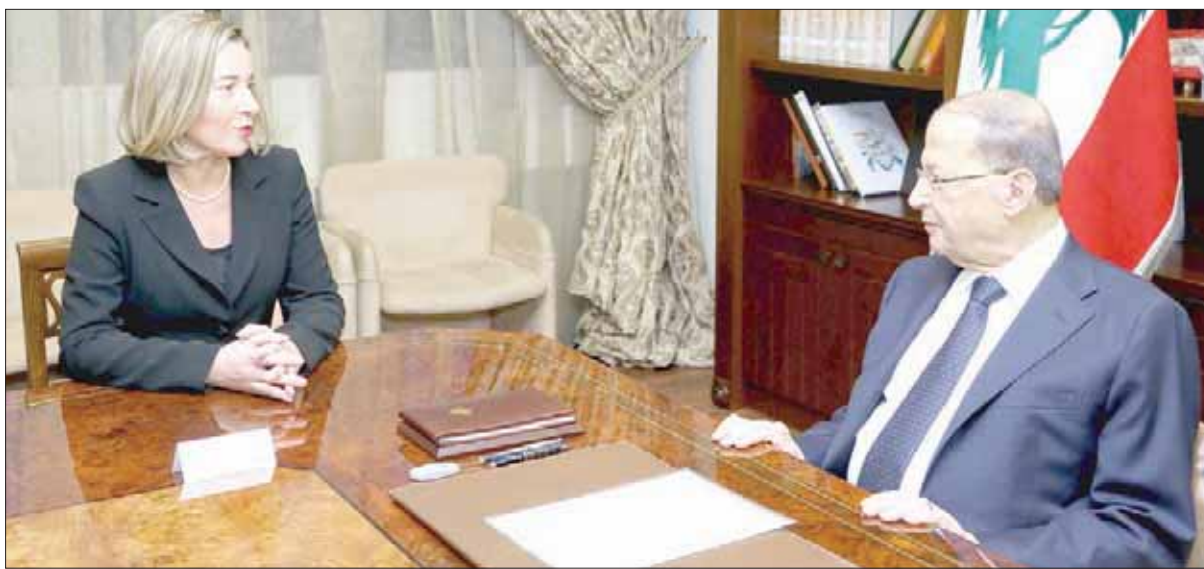
موغيريني وعون خلال لقاؤهما في بيروت أمس

أعلنت الممثلة العليا للشؤون الخارجية والسياسة الأمنية في الاتحاد الأوروبي فيديريكا موغيريني أن الاتحاد الأوروبي سيبقى إلى جانب لبنان لتقديم الدعم والمساعدة. وجاءت تصريحات موغيريني من القصر الجمهوري، حيث استقبلت زيارتها إلى العاصمة اللبنانية التي وصلتها بعد ظهر أمس آتية من بروكسل على متن طائرة خاصة للقاء المسؤولين اللبنانيين ولتأكيد دعم الاتحاد الأوروبي للبنان. وبعد لقائها عون، توجهت إليه بالقول: «نقدر حثمتكم في المحافظة على استقرار لبنان، والاتحاد الأوروبي سيبقى إلى جانبكم لتقديم الدعم والمساعدة». وأعرب رئيس الجمهورية العماد ميشال عون عن أمله في أن تسفر المؤتمرات التي ستعقد لدعم لبنان في باريس وروما وبروكسل خلال الشهرين المقبلين عن قرارات تنفيذية لجهة مساعدة الجيش والقوات المسلحة اللبنانية أو لدعم الاقتصاد اللبناني وتأمين عودة النازحين السوريين إلى بلادهم. وأبلغ عون موغيريني خلال استقبالها في قصر بعبدا أن لبنان الذي يقدر دعم الاتحاد الأوروبي لقضاياها، يأمل في