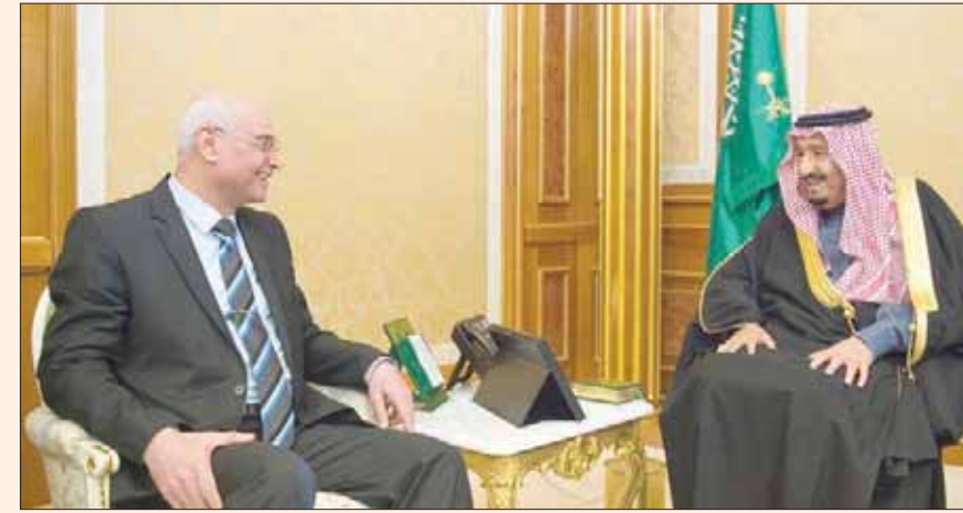
الملك سلمان بن عبد العزيز لدى لقائه رئيس ديوان الرقابة في العراق صلاح نوري خلف

بالعراق الدكتور صلاح نوري خلف، واستعرض اللقاء العلاقات الثنائية بين البلدين، وأفاق التعاون؛ خاصة في المجالات الرقابية. حضر اللقاء الأمير عبد العزيز بن سعود بن نايف بن