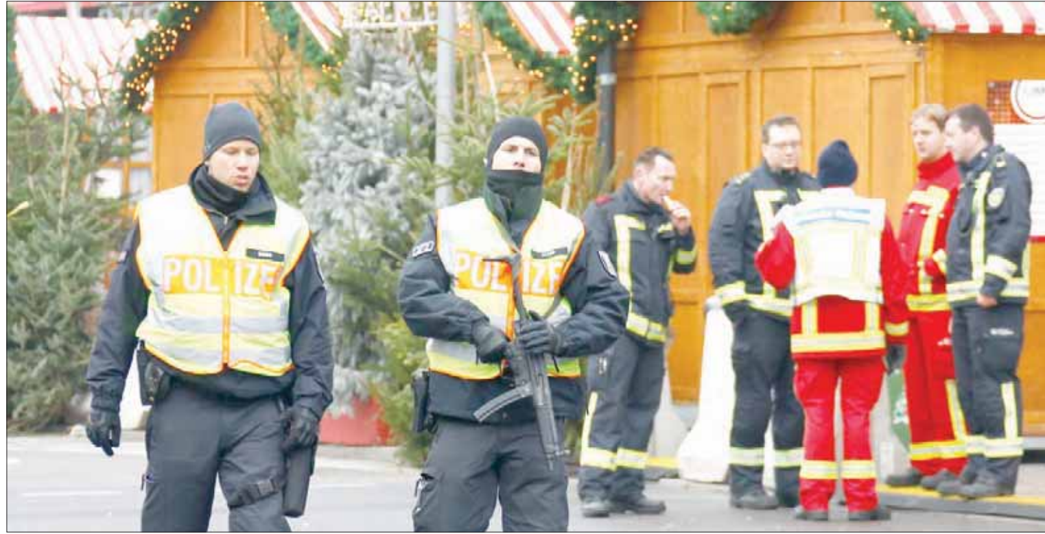
حضور أمني مكثف في سوق عيد الميلاد الذي شهد هجوم الدهس في برلين قبل عام

وقال شتاينماير في خطابه خلال فعالية إحياء الذكرى الأولى للهجوم بحضور عدد من أسر الضحايا، مستذكراً بقوله: «الذي تم تقديمه لذوي الضحايا والمصابين جاء متأخراً وظل غير مُرضٍ. وتابع قائلاً: «كثير من أسر الضحايا والمصابين - كثير من حضراتكم - شعر بأنه تم التخلي عنه من جانب الحكومة بعد الهجوم». وشدد شتاينماير على ضرورة ألا يرضخ المجتمع أمام الإرهاب، مستذكراً بقوله: «لكن لا يمكن أن يؤدي ذلك إلى كبت الألم والمعاناة». وأكد أن المجتمع يواجه الإرهاب أيضاً من خلال المشاركة في إحياء ذكرى الضحايا ومساندة أسرهم، وقال: «فكوتنا نحن معاً ونغضب معاً ونفخ معاً - ويندج ذلك أيضاً ضمن التكتات الذي نحتاج إليه كي ندافع معاً عن حريتنا». ووجه الرئيس الألماني خطابه للمصابين وأسرة الضحايا قائلاً: «أريد أن أؤكد لكم: لن نترككم وحدهم». وأعرب شتاينماير عن استيائه من وقوع الهجوم من الأساس، وقال: إنه أمر مؤلم أنه لم يتعدى للدولة إخماد الضحايا، مشدداً بقوله: «موقفنا يجب أن