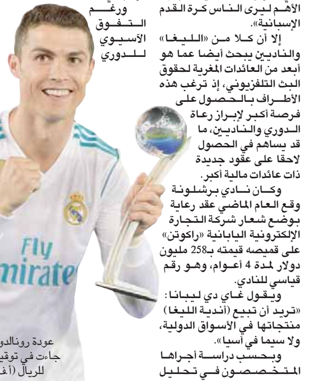
عودة رونالدو للتألق جاءت في توقيت مثالي للريال (أ.ف.ب)

ويقول غاي دي ليبيانا: «تريد أن تبضع (أندية الليغا) منتجاتها في الأسواق الدولية، ولا سيما في آسيا». وبحسب دراسة أجراها المتخصصون في تحليل