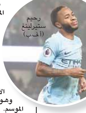
رحيم ستيرلينغ

وتعرض لانتقادات عدة، إلا أنه رفض التراجع عن الخطط التي يراها مناسبة، أو اعتماد أسلوب دفاعي، بدأ منسحباً على الملعب فيما رسمه، ومقتنعاً بالفريق واللاعبين سيمنسون بزمّام الأمور في نهاية المطاف وهو بالفعل ما تحقق هذا الموسم.