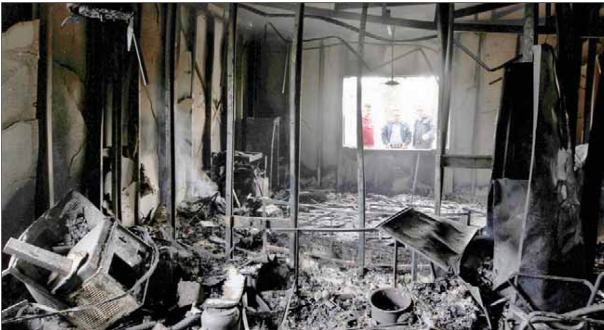
أربيل، «الشرق الأوسط»