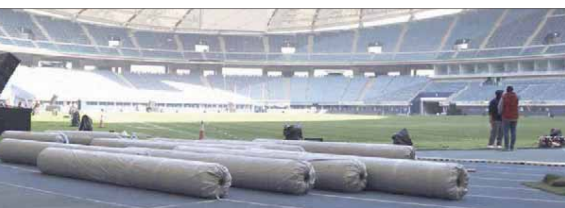
جانب من الاستعدادات في ملعب جابر الدولي