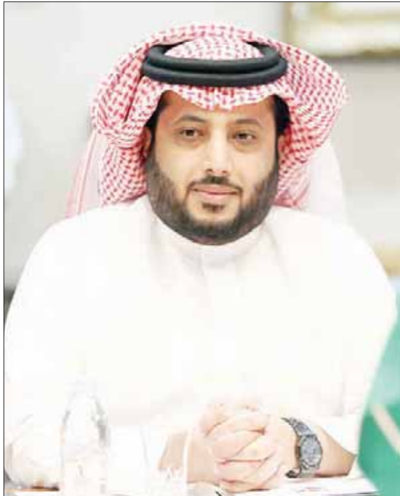
تركي آل الشيخ (الشرق الأوسط)

مواجهتي الذهاب والإياب ورغم المشاركة المتواضعة فإن البطولة استمرت قرابة العامين، وأقيمت النسخة الثانية مدينة الدمام السعودية عام 1984، وبمشاركة 4 فرق بنظام الدوري من دور واحد، وانتهت بتتويج فريق الاتفاق السعودي باللقب، وأقيمت النسخة الثالثة في 1985 في ضيافة العاصمة العراقية بغداد بمشاركة 3 اندية فقط، وتوج بلقبها الرشيد العراقي. وبدأ نظام التصفيات التمهيدية للبطولة اعتباراً من النسخة الأخيرة. وفي عام 2002 تم دمج كل البطولات العربية للأندية «كأس الأندية الأبطال» و«بطولة أبطال الكؤوس وكأس النخبة» في بطولة واحدة حملت مسمى «بطولة الأمير فيصل بن فهد للأندية العربية». وأقيمت بطولة 2002 في جدة بمشاركة 12 فريقاً، وحسم الأهلي السعودي اللقب. أما بطولة 2003 فأقيمت في مصر بتواجد 10 فرق، وذهب لقبها لمصلحة المنتخب العراقي لصالح الفريق العراقي بعد تغلبه على النجمة اللبناني بنتيجة 4 أهداف مقابل هدفين في مجموع أهداف