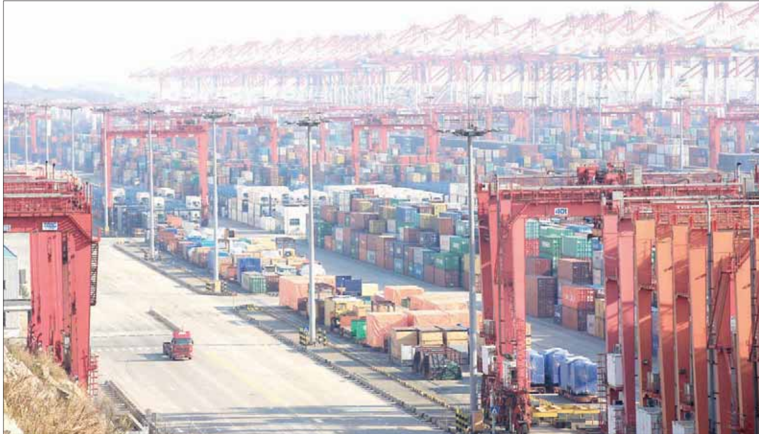
حاويات في منطقة التجارة الحرة بمدينة شنغهاي الصينية

2018، بحسب الوكالة. وبدأ التصدي لمشكلة تلوث الهواء يؤثر بشكل فعلي على النمو الاقتصادي. وأظهرت الأرقام الرسمية الأسبوع الماضي تباطؤ الإنتاج الصناعي في نوفمبر الماضي، بعد أن أجبرت السلطات مصانع الصلب ومراكز الصهر في مدن شمالية على خفض الإنتاج، وقد قلص بعضها الإنتاج إلى النصف. ومنح خفض الإنتاج الصناعي والإجراءات المرافقة له الهادفة إلى اعتماد البلاد على الغاز الطبيعي