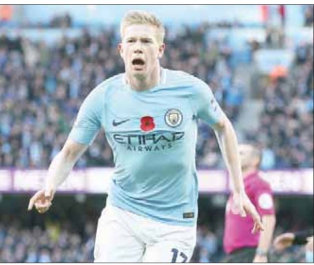
دي بروين أثبت أنه العنصر الأبرز في صفوف سيتي والدوري الإنجليزي

حزبها والبطل في نهاية الموسم تشيلسي. وأنهى النادي الشمالي البطولة بفارق 15 نقطة عن البطل، والموسم دون أي لقب. لكن غوارديولا قام بحملة