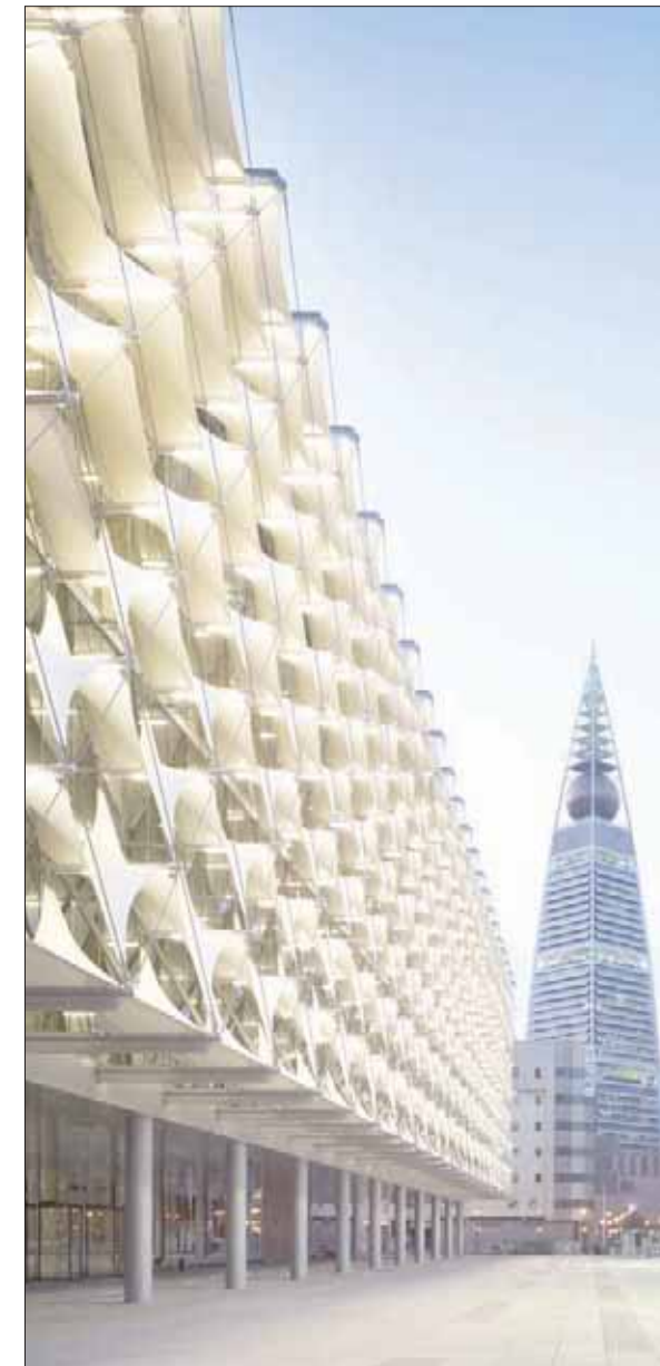
مكتبة الملك فهد الوطنية بالرياض (كريستيان ريكتور)