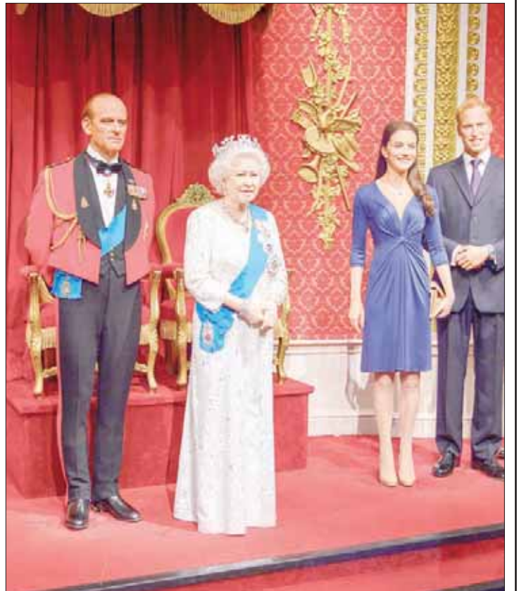
تماثيل العائلة المالكة البريطانية في «متحف الشمع»

● متحف «مدام توسو» مكان شهير يعرض تماثيل مصنوعة من الشمع لمشاهير رحلوا أو لا يزالون على قيد الحياة. ويعد هذا المتحف واحد من أهم الأماكن والمزارات السياحية في لندن. ولدت ماري غروشولز، وهو اسم «مدام توسو» قبل زواجها، في ستراسبورغ بفرنسا عام 1861 (التاريخ الصحيح 1761)؛ وتوفي والدها وهي في السادسة من العمر، وعملت والدتها مديرة منزل لدى طبيب كان فناناً أيضاً يجيد تشكيل الشمع. وهو من علم ماري أصول هذا الفن. انتقلت ماري للإقامة في باريس، وبدأت تصنع أعمالاً من الشمع وتعرضها، وتزوجت من مهندس مدني يدعى فرانسوا توسو عام 1795 وانتقلت إلى لندن عام 1802، وأقامت معرضاً يضم تماثيل شمع لشخصيات شهيرة، وانتقلت به في أنحاء البلاد. وفي عام 1835 أنشأت متحفاً دائماً للشمع في شارع «بيكر ستريت». توفيت توسو عام 1850، لكن واصلت أسرته ما بدأتها، وأقامت المقر الحالي في شارع «مارليبون رود»، الذي تم افتتاحه عام 1884، وأصبحت مجموعة «دابلستون»، وهي شركة أسهم خاصة أميركية،