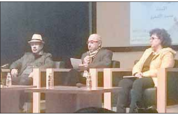
الرباط،