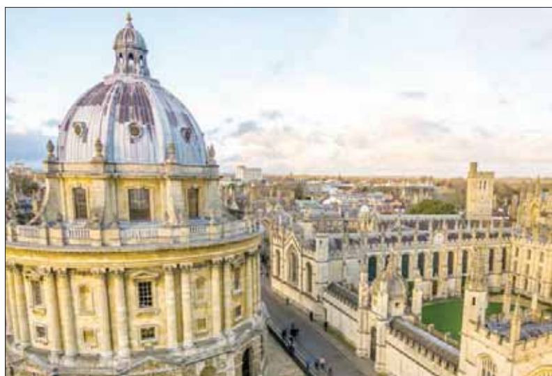
مدينة أكسفورد العريقة قبل الميلاد

لكن الظاهر الجمهور الزائر في هذا العام هو مناخ الاحتفال المعتاد سنوياً مع البهجة التقليدية التي تصاحب موسم نهاية العام. فالأضواء ارتفعت بالفعل على شوارع وسط المدينة، وبدأ موسم التسوق لاحتفالات نهاية العام يكتسب زخماً مع اقتراب العام الجديد.