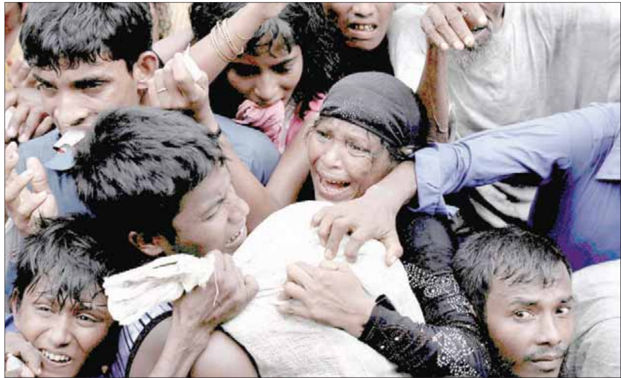
لاجئو الروهينغا يتلقون إمانات في منطقة كوكس بازار البنغلاديشية في سبتمبر الماضي