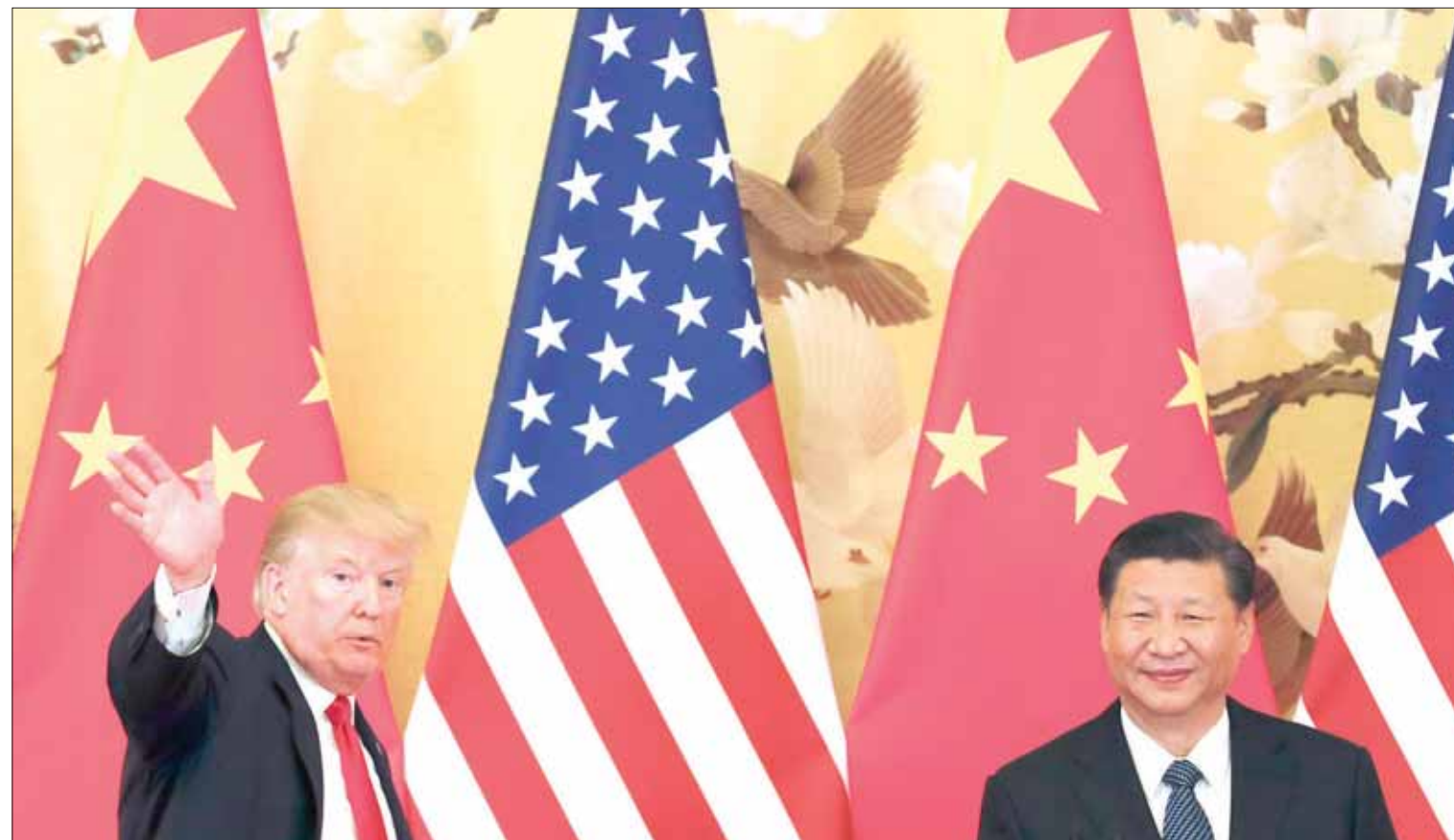
صورة لترمب وشي قبل عقدهما مؤتمراً صحافياً في بكين الشهر الماضي

وروسيا، وأي تواطؤ محتمل بين مقربين من ترمب وموسكو خلال الانتخابات الرئاسية عام 2016. ورفض الرئيس الـ45 للولايات المتحدة التهم، ووصفها بـ«الأخبار الكاذبة». وتحذر استراتيجيته الأمنية الجديدة من أن الأسلحة النووية الروسية «أكبر تهديد وجودي للولايات المتحدة». لكن المتحدث باسم الكرملين رأى في التقرير «بعض النقاط الإيجابية»، مشيراً إلى «رغبة واشنطن» في التعاون مع روسيا في المجالات التي تتوافق مع مصالح الأميركيين.