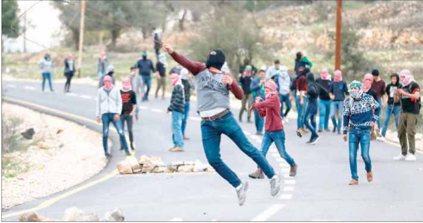
متظاهرون فلسطينيون خلال اشتباكات مع الاحتلال على أطراف القدس أمس

بأبلا ويتعين نفضه، إلى الجمعية العامة للأمم المتحدة، في جلسة طارئة تحت عنوان «متحدون من أجل السلام»، كرد على استخدام الولايات المتحدة «الفيغو» وقال وزير الخارجية الفلسطيني رياض المالكي، أمس، إن «القرار مثل فرصة للولايات المتحدة للتراجع عن قرارها غير القانوني، وعودتها للتفاوض مع ميثاق الأمم المتحدة والقانون والإرادة الدولية، ولكنها مع الأسف اختارت الوقوف على الجانب الخطأ من التاريخ، والانتحار إلى الاستعمار والظلم، وكل ما يقوّض جهود السلام في الشرق الأوسط والعالم». وطالب الولايات المتحدة بـ«التراجع عن قرارها»، وشدد على أن «استخدامها للفيغو لا يحتمل من تحمل مسؤولياتها، وهو انتهاك جديد للمبادئ التي قامت عليها الأمم المتحدة، ومخالفة لميثاقها وعمل مؤسساتها».