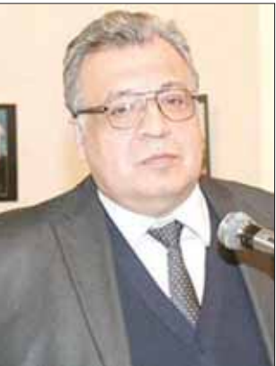
السفير كارلوف («الشرق الأوسط»)

(أي بي)، المستخدم أثناء عملية الحذف، هو شبكة (إكسبريس في بي إن) التي تتخذ من الولايات المتحدة مقراً لها، التي لا تخزن سجلات اتصال. ولم يتمكن مكتب المدعي العام التركي من الحصول على رد إيجابي من مكتب التحقيقات الفيدرالي الأميركي (إف بي آي) بشأن العثور على محتويات حساب البريد المحذوف.