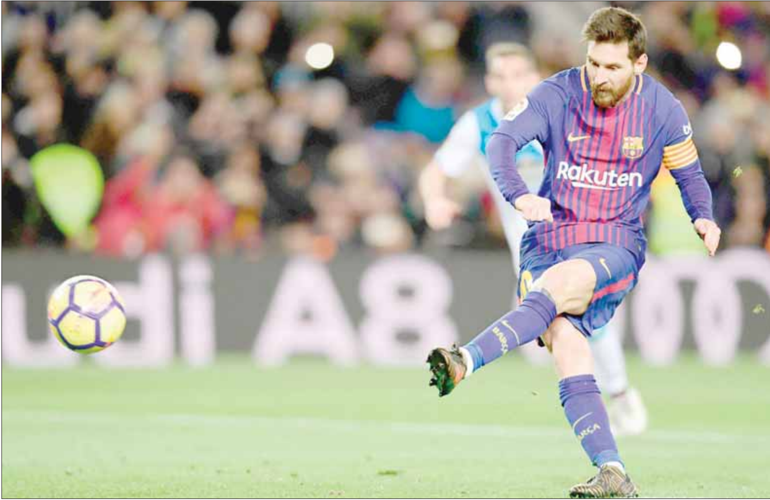
ميسي صوب 3 مرات في عارضة وقائم لأكورونيا لكنه ما زال يتصدر هدافي الدوري الإسباني

غريبة ومبالغ فيها بشكل كبير في الوقت نفسه، فقد وصلت تسديدات قائد منتخب الأرجنتين المرتدة من القائمين والعارضة هذا الموسم إلى 14 تسديدة. وكانت 12 تسديدة من هذه في مسابقة الدوري الإسباني التي سجل خلالها ميسي 14 هدفاً حتى الآن، مما يعني أنه لو كان أفلح في التسجيل من الكرات المهجرة لوصل عدد أهدافه إلى رقم مخيف.