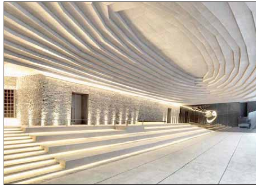
سانكاكسر مسجد سانكاكسر في اسطنبول (كميل امدين)