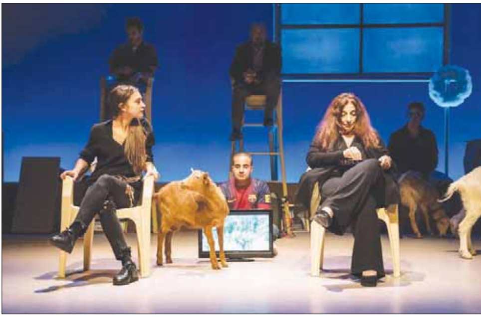
مشهد من المسرحية

الحوان الذي يرخص ذكرى موتاهم؟ تلك الأثمان التي تدفعها المجتمعات لقاء قمع باطش وحرب أهلية تبدو عصية على الفرض. تغمر أكاذيب الحكومة الشبان بفرض رقابة صارمة على الإنترنت والتنصت على الهاتف. ويأخذ المواطنون بأسباب حيازة من البطولة المخطئة بالخدعة والوطنية الزائفة، بطولته تسمى الوافق على الجانب الآخر «إرهايبا» حتى لو كان جارا قطن القرية المجاورة ذات يوم. في شهر يناير (كانون الثاني) 1989 كتب رجل قاد ثورة خطاباً لرجل حاول ردم الثورة تحت التراب قال فيه: «السيد غورباتشوف، لا بد من مجابهة الواقع»، ولجابهته بفرض المجتمع النائم مرتابين تقودهم ايدولوجيا مخالفة. حين يواسي مندوب النظام الناجين معيدا تفسير ارتجادي الحرب على هواء، يشكك فوراس الأب الحكوم في الرواية الرسمية. من المعتدي ومن المعتدى عليه؟ كيف مات فلذات الأيكاد؟ فلنتكشف الأكلان إذن عما يحويها!