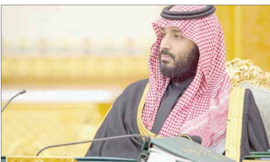
الأمير محمد بن سلمان خلال جلسة مجلس الوزراء الخاصة بالميزانية العامة للدولة

للعام القادم سيؤدي إلى مزيد من التنمية الاقتصادية وخلق مزيد من الفرص الوظيفية للمواطنين ويساعد القطاع الخاص على فتح مجالات جديدة للاستثمار. وأشار إلى أن الميزانية تتضمن اعتمادات مخصصة لتوفير مزيد من المنتجات السكنية، كما سيتم دعم توصيل 700 ألف منزل بشبكة الألياف البصرية لتوفير خدمات اتصالات تساعد المواطنين على الحصول على مزيد من السرعة. ونوه بأن برامج الإصلاح الاقتصادية تحت «رؤية السعودية 2030» بدأت تحقق نتائج ملموسة، حيث سيتم تمويل ما يقارب من 50 في المائة من ميزانية هذا العام من دخل ومصادر غير نفطية، «بما في ذلك الإيرادات الجديدة غير النفطية»، إضافة إلى منتجات أدوات الدين، مشيداً بالجهود