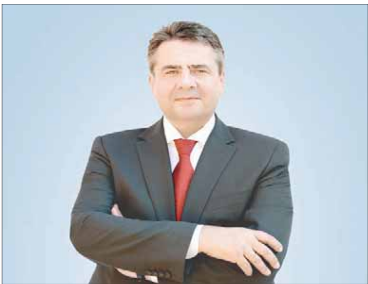
وزير الخارجية الألماني

إن التقارير حول الاتجار بالبشر في ليبيا مزرعة. وقد اتفق الأوروبيون والاتحاد الأفريقي بايديجان في مباحثات بناءة جداً على تحسين أوضاع اللاجئين والمهاجرين داخل البلاد. وستُخذ هذه الخطوات بالتنسيق وثيق مع حكومة العراق الوطني الليبية التي يجب أن تتحمل المسؤولية إزاء معاملة اللاجئين المهاجرين داخل البلاد بما ضمن كرامتهم. ومن المهم الآن التنفيذ المباشر لما تم الاتفاق عليه بايديجان، وكذلك ضمان إجراء تحقيقات سريعة لكشف حقيقة الاتهامات المتعلقة بالاسترقاق في ليبيا.