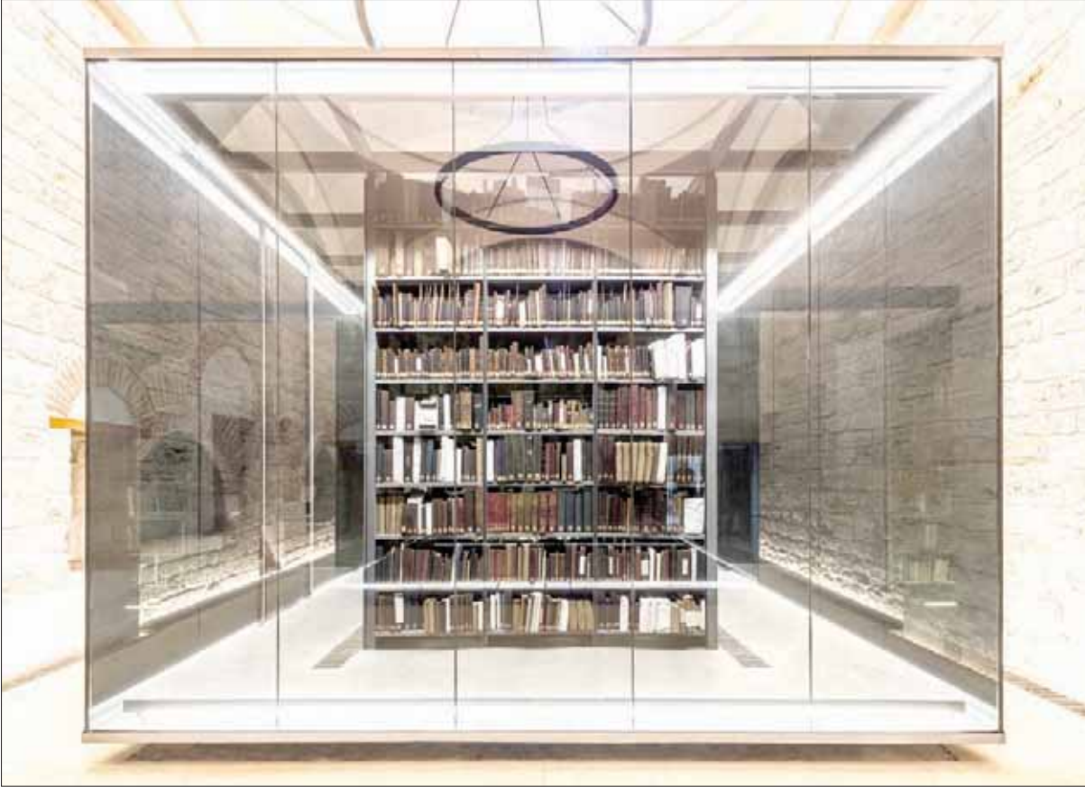
مكتبة بيازيت في اسطنبول (إيري دورتر)