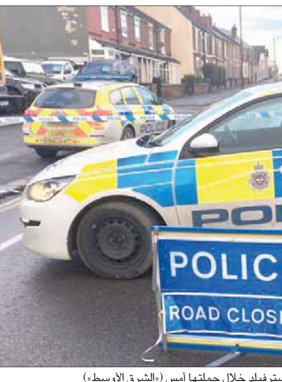
الشرطة تغلق طريقاً في شيفستر فيلد خلال حملتها أمس

وأردف توماس: «ولكن في إطار المناخ الحالي، ندرك أهمية التأكد من وجود الضباط المختصين وذوي التدريب الراقي في الأماكن المناسبة وفي الأوقات المناسبة للحفاظ على أمن وسلامة المواطنين. الأمر الذي يدفعنا لمحاولة تجنيد مزيد من القوات».