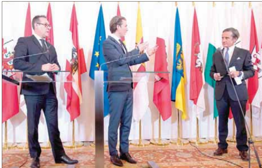
المستشار النمساوي ونائبه يعقدان مؤتمراً صحافياً في فيينا أمس

كريستيان شتراخه علاقته مع حزب الحرية اتفاق تعاون مع حزب «روسيا المتحدة» بزعامة الرئيس فلاديمير بوتنن الساعي إلى التقارب مع الأحزاب الشعبوية في أوروبا الغربية. وقد يسفر هذا التقرب عن انعدام ثقة الأوروبيين في النمسا، وفق وكالة الصحافة الفرنسية.