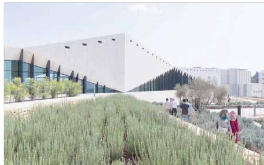
المتحف الفلسطيني في بيرزيت (إيوان بان)