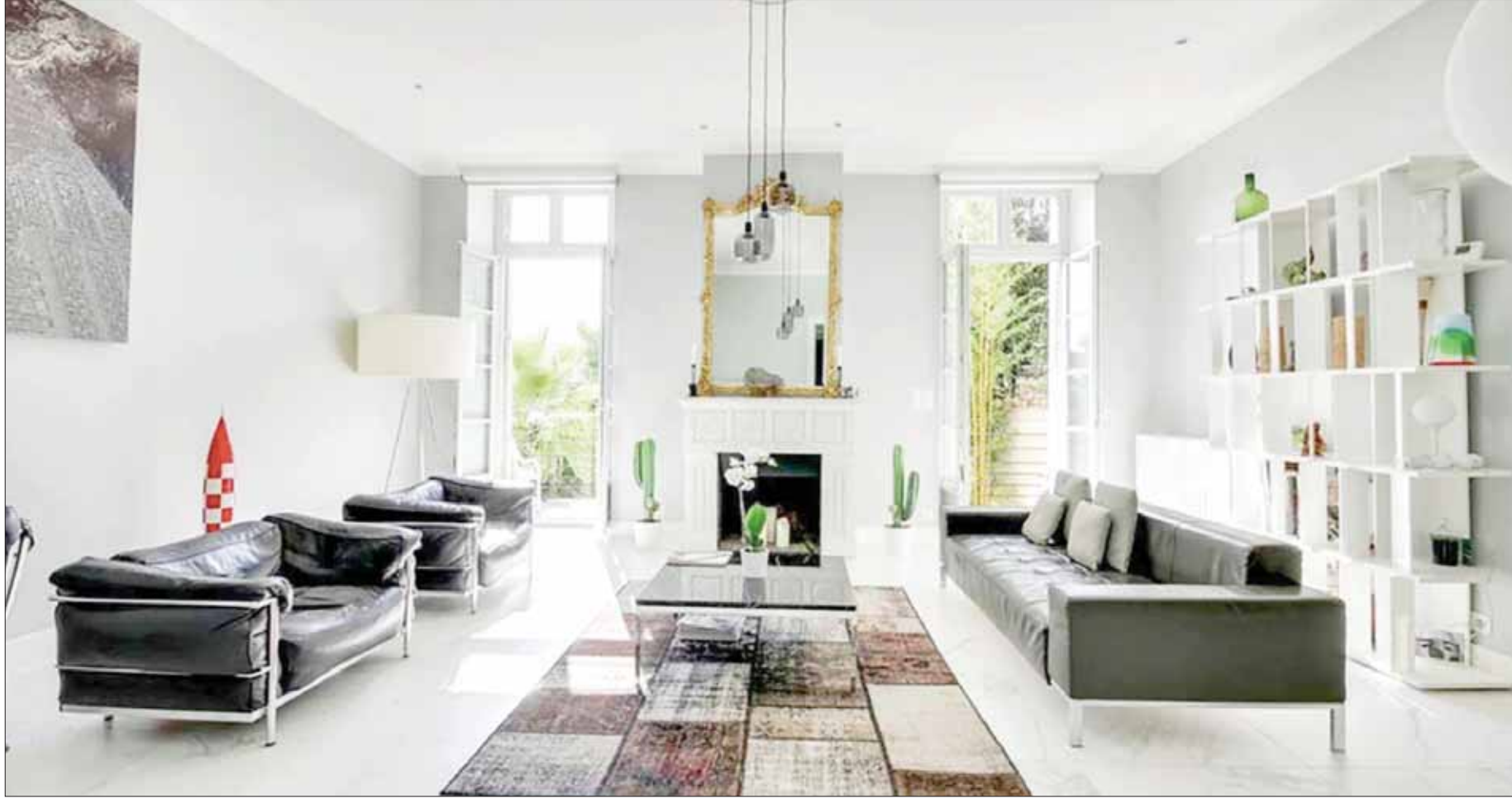
أسعار المنازل الفاخرة في بورده ارتفعت منذ عام 2014

وسويسرا، والولايات المتحدة الأميركية، والصين، ولبنان، في حين كان نصف عدد المشترين الفرنسيين من سكان المنطقة، والنصف الآخر من باريس في أكثر الأحوال. وأوضح بينز أن 10 في المائة فقط من مشتري مزارع العنب من فرنسا، في حين يمثل الأميركيون 40 في المائة من المشترين، والنسبة الباقية من مناطق أخرى من أوروبا وآسيا.