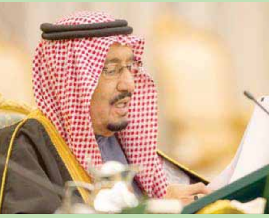
الملك سلمان بن عبد العزيز خلال كلمته أمس بمناسبة إعلان الميزانية العامة للدولة

الشرق الأوسط - النشرة - مجلة تفاعلية جديدة www.aawsat.com