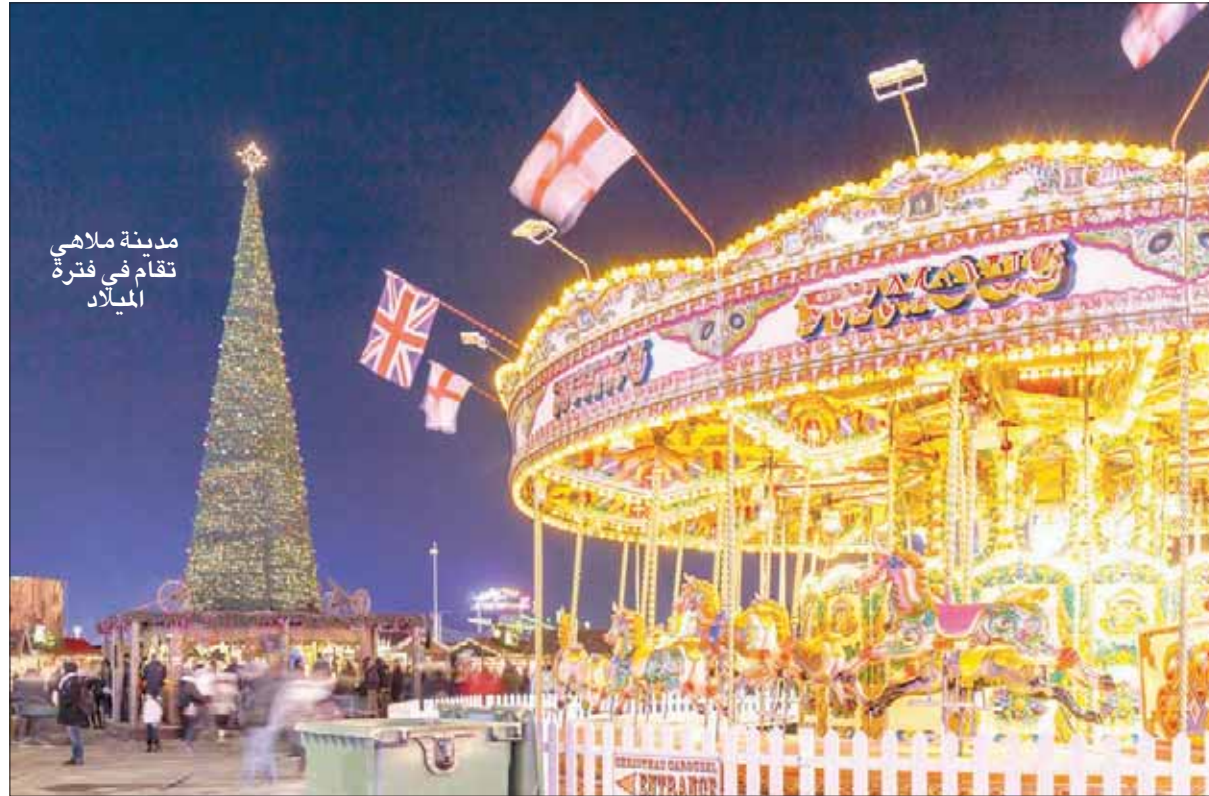
مدينة ملاهي تقام في فترة الميلاد

الرحلة طوال فترة 24 ساعة تكون التذكرة صالحة خلالها. وتوفر هذه الحافلة أيضاً شرحاً سياحياً بلغات عدة لمن يريد.