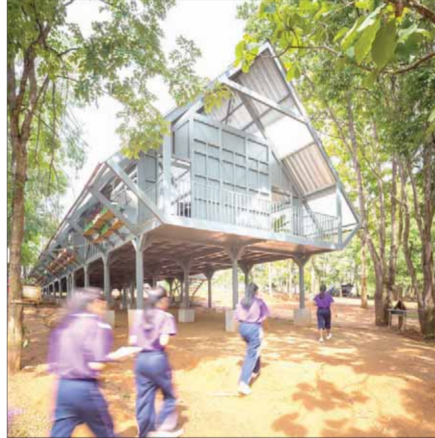
مدرسة أقيمت بعد زلزال في تايلاند (بيرك أنوراكاياشن)