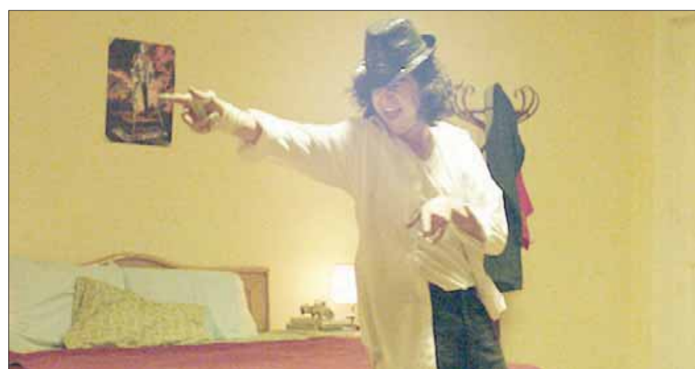
الممثل أحمد مالك في مشهد من «الشيخ جاكسون»

من جانبها، قالت الناقدة الفنية ماجدة خير الله لـ«الشرق الأوسط»: «حالة القضية المقدمة ضد صنع فيلم (الشيخ جاكسون) للجنة تابعة للأزهر الشريف، ردة فنية تعيدنا قرناً من الزمان للورا». ووصفت الأمر بـ«الكارثة»، موضحة «أن إحالة الفيلم للأزهر الشريف لإبداء الرأي فيه أعاد للذهان ما حدث لصنع فيلم (المذنبون) الشهير، الذي كان يناقش قضايا مهمة وخطيرة للغاية»، مشيرة إلى «أن فيلم (الشيخ جاكسون) لم يحمل أي رسائل فنية وسياسية تغضب أحداً مثلما فعل فيلم (المذنبون)». وأضافت خير الله قائلة: «الفيلم مجرد خيال، ولا يمت للواقع بصلة، هل نحاسب السينمائيين على خيالهم وإبداعهم، وهي وظيفته الأساسية، كما أن الفيلم لم يسيء إلى الإسلام أو الأزهر، وقصة الفيلم الأساسية مبنية على شخص معجب بالطرب الأميركي، وأوضحت خير الله، أن الفيلم لم يتم تصويره داخل المساجد، بل تم تصويره داخل استوديوهات خاصة بالسينما. وربطت الناقدة الفنية ما قدمه الفيلم من خيال، وما يحدث في الواقع لبعض المصلين، الذين ينشغلون بأمور الدنيا