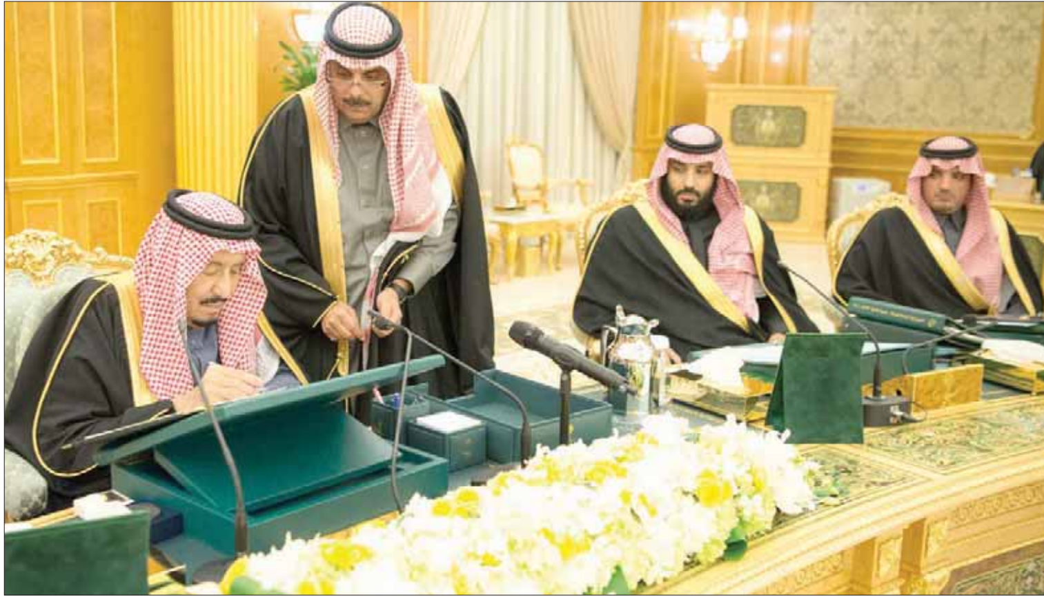
خادم الحرمين الشريفين لدى توقيع على المرسوم الملكي الخاص بالميزانية... ويبدو الأمير محمد بن سلمان ولي العهد والأمير عبد العزيز بن سعود بن نايف وزير الداخلية (واس)

وأشار إلى توقعات المالية العامة في المدى المتوسط لـ«تطورات برنامج تحقيق التوازن المالي»، والية تنفيذ، وإيرادات وفترات العام المالي 2018م، وقال: «تتشير التقديرات إلى بلوغ إجمالي الإيرادات حوالي 783 ملياراً بزيادة 12,6 في المائة عن المتوقع عام 2017م، وتم اعتماد ميزانية سيكون الإنفاق فيها 978 مليار ريال مرتفعة عن العام السابق بنسبة 5,6 في المائة، حيث يدفع هذا الارتفاع التوسع في الإنفاق على مخصصات مبادرات برامج الرؤية (2030)، كما تحدث عن ميزانية العام المالي 2018م على مستوى القطاعات، والمخاطر الاقتصادية والمالية والعوامل الإيجابية للاقتصاد.