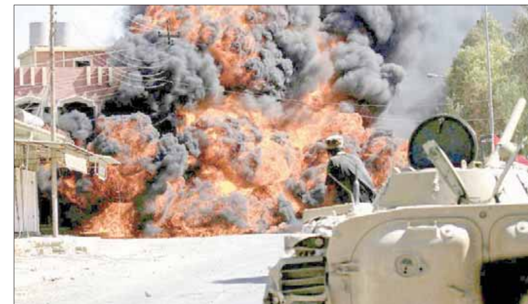
انفجار في طوز خورماتو التي تعصف بها التوترات العرقية

بهدف إفرانغ من سكانه التركمان، ولا سيما الشيعة منهم، قائلًا: إن «ما يحصل الآن من استهداف مستمر للقضاء طوز خورماتو هو ردة فعل للهزيمة التي لحقت بالكرد بعد الاستفتاء بعد أن فرضت الحكومة سلطتها في وقت كانت فيه الأحزاب الكردية ضالعة في تهريب النفط والغاز»، مشيرًا إلى أن «الجهات التي تستهدف القضاء، وهم خليط من جماعات الرابيات البيضاء والعمال الكردستاني وجهات أخرى تمولها الأحزاب الكردية التي خسرت المواجهة، وكذلك امتيازاتها تقول إن التركمان تعاونوا مع الحكومة، بينما حقيقة الأمر أن التركمان الخاسر الأكبر كونهم يدفعون عن الخلفات العربية - الكردية في المناطق ذات الغالبية التركمانية».