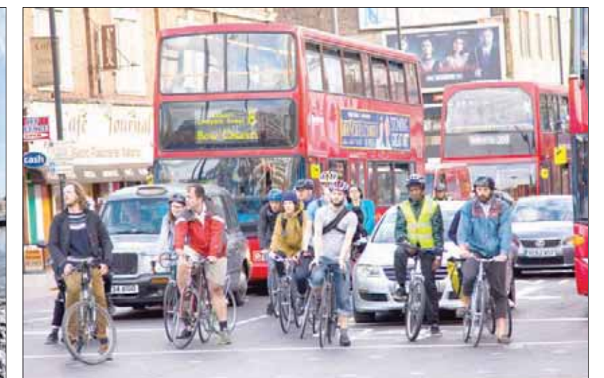
رحلات على الدراجات الهوائية