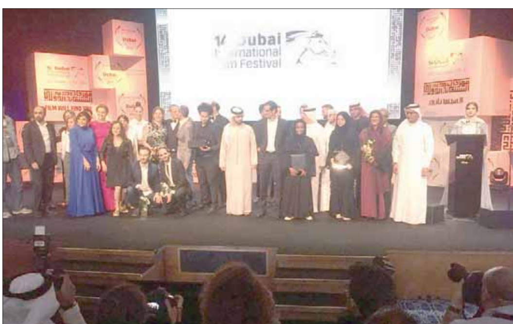
من حفل توزيع الجوائز

يهربون إليها من التلوث وبرودة الطقس في مدنهم