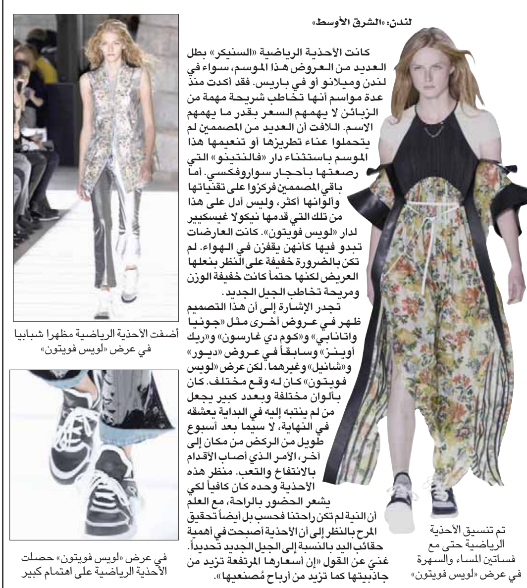
لندن، «الشرق الأوسط»

كانت الأحذية الرياضية «السننجر» بطل العديد من العروض هذا الموسم، سواء في لندن وميلانو أو في باريس. فقد أكدت منذ عدة مواسم أنها تخاطب شريحة مهمة من الزبائن لا يهمهم السعر بقدر ما يهمهم الاسم. الألفت أن العديد من المصممين لم يتحملوا عبء تطريزها أو تعميمها هذا الموسم باستثناء دار «فالتينو» التي رصعتها بأحجار سواروفكسي. أما باقي المصممين فركزوا على تقنياتهما والوانها أكثر، وليس أدل على هذا من تلك التي قدمها نيكولا غيسكيير لدار «لويس فويتون». كانت العارضات تبدو فيها كأنهن يقفن في الهواء. لم تكن بالضرورة خفيفة على النظر بنعلها العريض لكنها حتما كانت خفيفة الوزن ومريحة تخاطب الجيل الجديد.