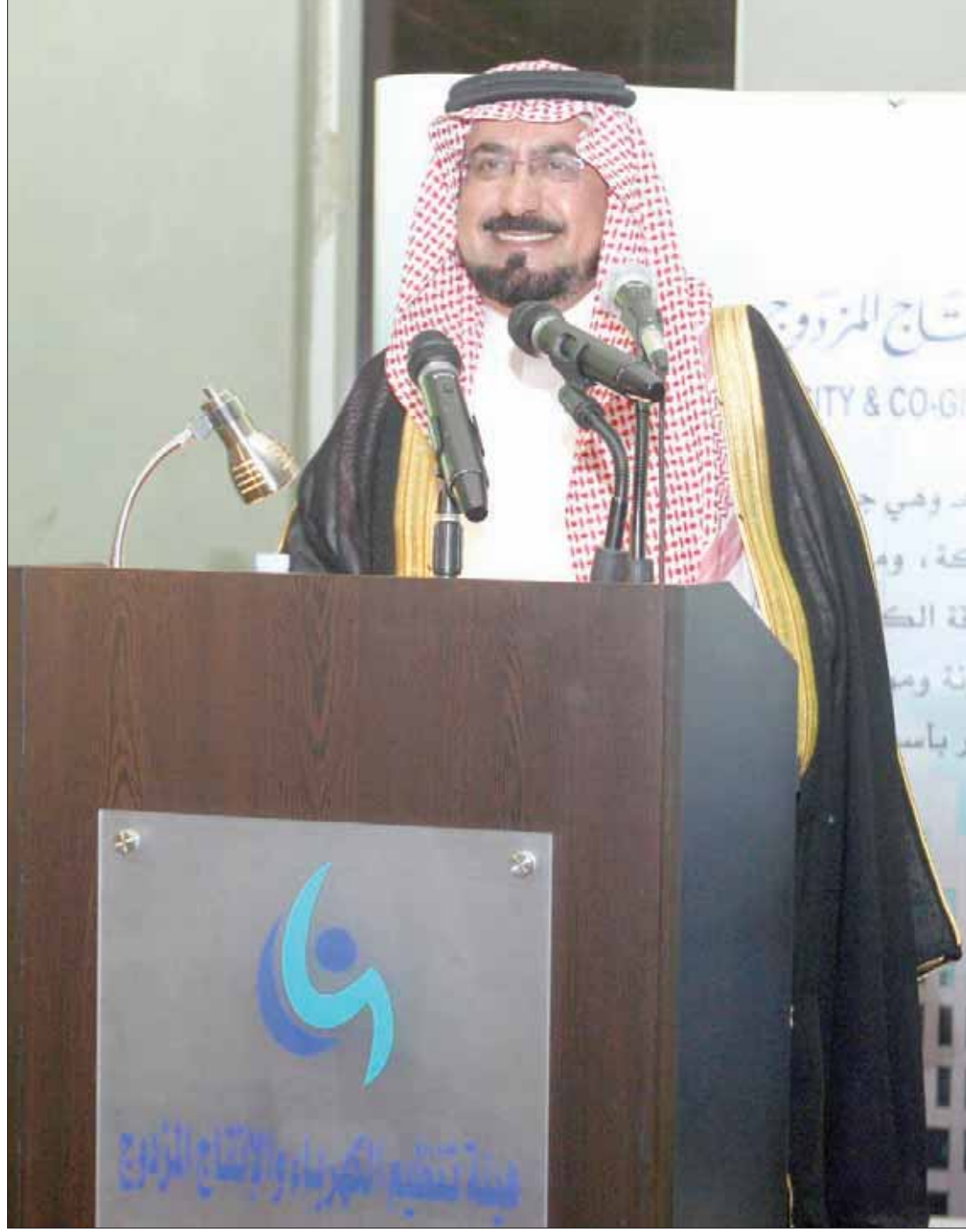
الدكتور عبد الله الشهري محافظ هيئة الكهرباء والإنتاج المزدوج بالسعودية