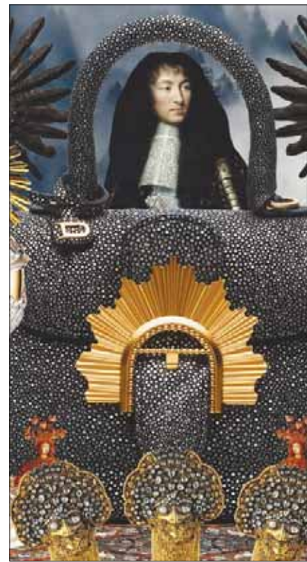
تعبر المجموعة عن عشق المصممة كريستينا زيلر بالقرن الوسطى

في عرض «لويس فويتون» حصلت الأحذية الرياضية على اهتمام كبير