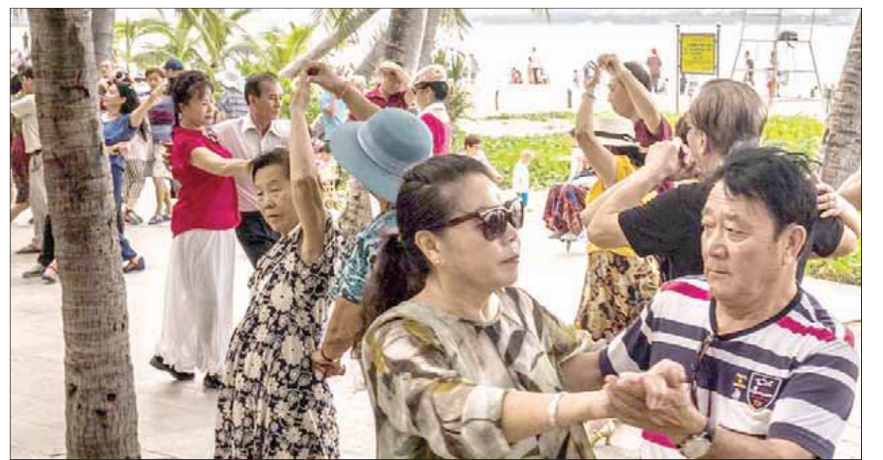
يتخذ المتقاعدون الصينيون من مدينة سانيا الساحلية منتجعا يقضون فيه الوقت مع أصدقاء في الرقص والألعاب التقليدية (نيويورك تايمز)