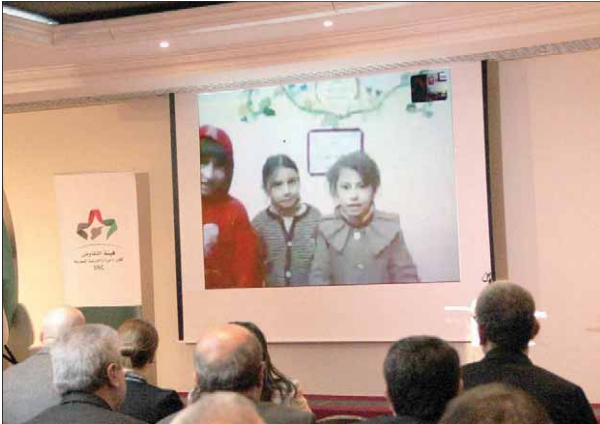
جنيف، «الشرق الأوسط»

جانب من فعالية هيئة التفاوض السورية حول الكارثة الإنسانية في القوطة الشرقية لدمشق على هامش مفاوضات جنيف («الشرق الأوسط»)