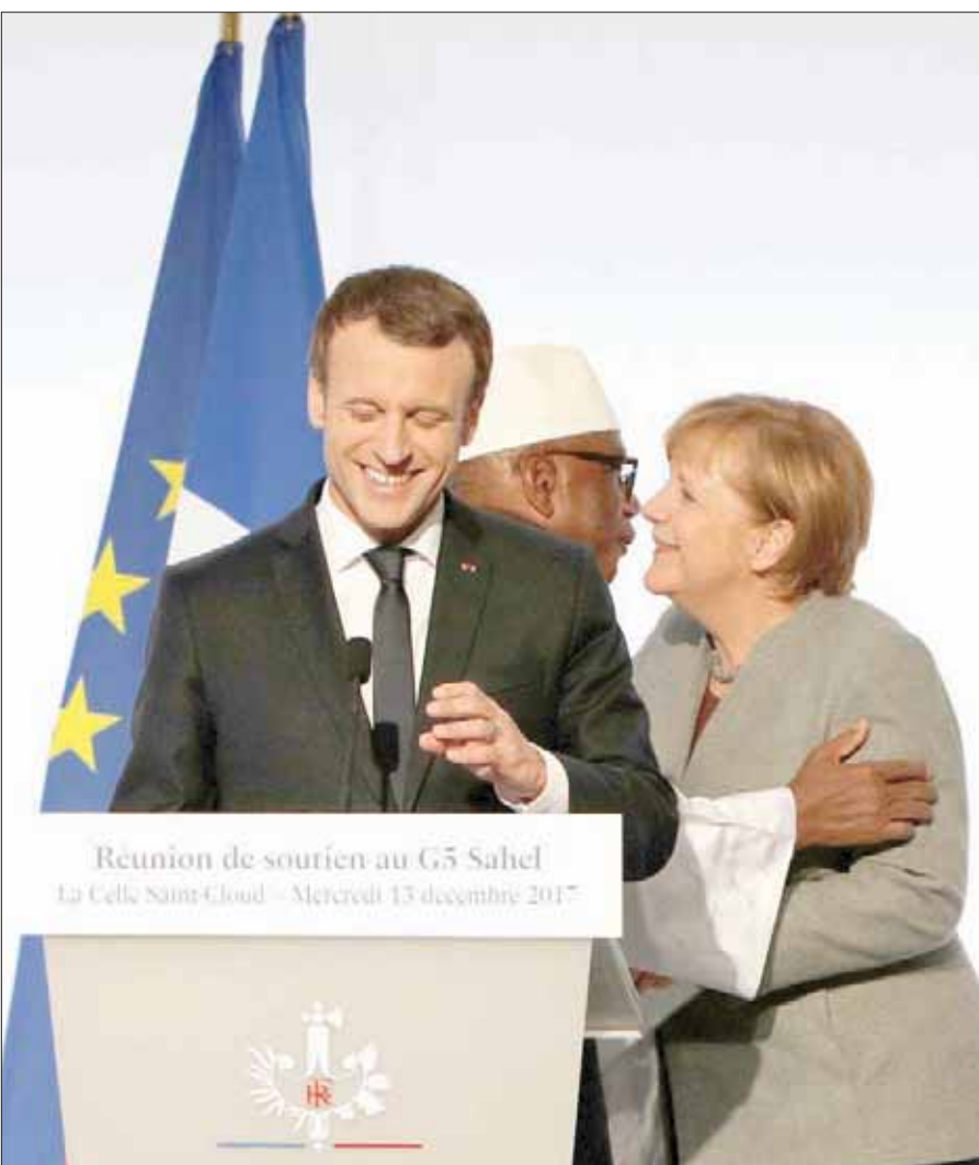
الرئيس الفرنسي إيمانويل ماكرون وخلفه المستشار الألمانية أنجيلا ميركل ترحب برئيس مالي إبراهيم بوبكر كيتا

وفي المؤتمر الصحافي الذي تلا القمة، قرع ماركوز ناقوس الخطر. وقال الرئيس الفرنسي: «علينا أن نربح الحرب على الإرهاب في منطقة الساحل، والحال أنها مشتتة، وهناك عمليات هجومية كل يوم، وثمة دول مهددة، (ولذا) علينا أن نتخف جهودنا». والهدف الذي عينه ماركوز هو «إحراز انتصارات في الفصل الأول من عام 2018» وهو ما دعا إليه أيضا الرئيس المالي إبراهيم بوبكر كيتا الذي وعد باستمرار الجهود من أجل «إيصال السلام فعلياً في مالي». من جانبها، قالت المستشارة الألمانية إنه «لا يعد من الممكن الانتظار». وكان واضحاً من خلال ما قيل علناً وما تسرب عن الاجتماع أن الأوروبيين والأميركيين مارسوا ضغوطاً على الأفارقة لبحث الخطى الإسراع في تشكيل الأطر العسكرية والهيكلية التنفيذية، فيما هم يتكفلون بتوفير التمويل والعتاد والتخطيط والمعلومات.