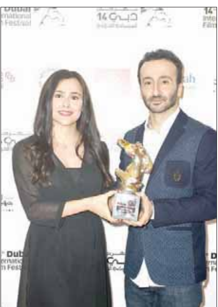
المخرج اللبناني لوسيان بو رجيلي حصد جائزة لجنة التحكيم الخاصة عن فيلمه الروائي «غداء العبد»

«واجب»، الفائز بـ«المهر الروائي» هو حكاية يوم واحد يشترك فيه أب (محمد بكري) وابنه (صالح بكري) في اللقطة على أفراد عائلة وأصدقاء