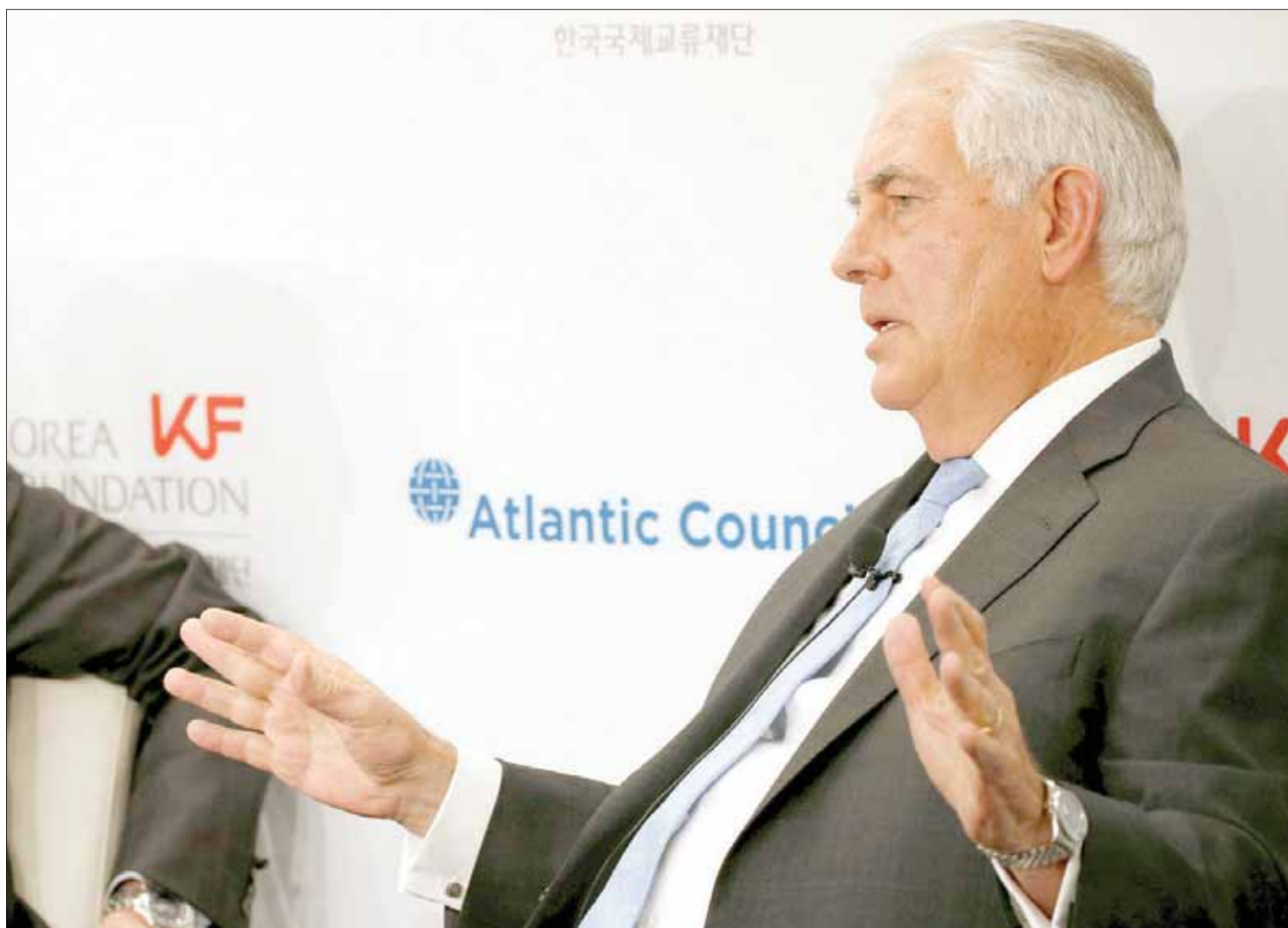
وزير الخارجية الأمريكي ريكس تيلرسون خلال اجتماع منتدى سياسات المجلس الأطلسي حول الأزمة الكورية في واشنطن

أضاف فيلتمان أن زيارته الأخيرة لكوريا الشمالية كانت أهم مهمة قام بها في حياته العملية مشيراً إلى أنها «مسؤولة ملقاة على عاتقه» إلا أنه قال إن الوقت فقط سيحكم بشأن «الأثر الذي أؤن فيما يخص الحوار». وكتب ترampf في تغريدة في أوائل أكتوبر (تشرين الأول): «إنه (تيلرسون) يضعه وقته في التفاوض». وهم مصراعيه الآن من إيجاد حل تفاوضي سلمي. وقال فيلتمان إنه «شدد على الحاجة الملحة إلى منع سوء الحسابات والحد من مخاطر الصراع» قائلاً: «ليس لدينا وقت لإضاعته»، وأكد على «ضرورة التنفيذ الكامل لجميع قرارات مجلس الأمن ذات الصلة». ووصف فيلتمان بعد الجلسة للصحفيين بأنها كانت أول زيارة معقدة للتبادل السياسي لآراء بين الأمانة العامة للأمم المتحدة ويجونغ يانغ منذ ما يقارب 8 سنوات، مضيفاً أن الحل السلمي كان موضوع الرسالة التي صاحبتها جونغ يانغ، وقال: «لقد لمست منهم أنهم اتفقوا على أنه من صاروخ الأخير القادر، بحسب الخبراء، أن يبلغ القارة الأمريكية. وعلى الصعيد الشخصي،