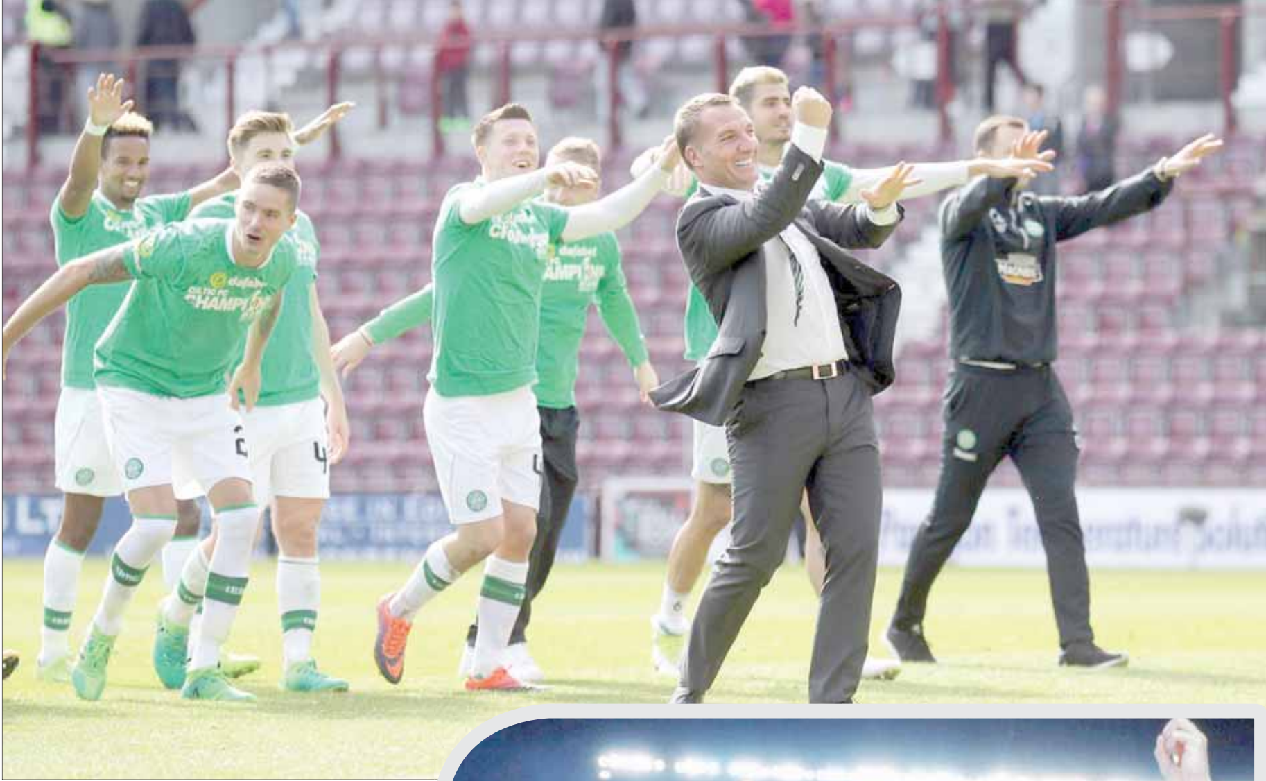
فريق سلتيك بقيادة بيرندان روجرز فرض سيطرته على الكرة الاسكتلندية

ورغم رحيل بيني عن «ستيو بوخارست» ليقول مهمة تدريب المنتخب الروماني بعد الفوز الذي حققه في إسبيلية، لكن النادي لم يعان في غيابه، وإنما ظل وهو تحد يعمل من أجل تحققة الداخلي والخارجي تحت قيادة خليفة بيني ونذاعه الأيمن سابقاً، يوردانيسكو.