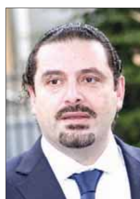
رئيس الحكومة سعد الحريري

احترم السجل المباشر بين تيار «المستقبل» وحزب «القوات اللبنانية» بعد فترة من الأخذ والرد عبر قنوات خلفية وعن طريق مصادر غير معلنة. وتدهورت العلاقة بين الطرفين بعد إعلان رئيس الحكومة سعد الحريري استقالته وما تلاها من اتهامات لـ«القوات» بالوقوف في غير صفه. وما ساهم في تنامي الخلاف إعلان الحريري مطلع الأسبوع الحالي أن «هناك أنزاساً سياسية حاولت أن تجد مكاناً لها في هذه الأزمة من خلال الطعن بالظهور»، متوعداً بـ«تسمية الأخطاء باسمائها وبق البحصّة»، التي وصفها بـ«الكبيرة»، قبل أن يعود ويتراجع معلناً تأجيل مباحثته التفاوضية. لكن ما لم يقله الحريري، قاله الأمين العام لـ«تيار المستقبل» أحمد الحريري، أمس، متحدثاً عن «علامات استفهام كبيرة مع (القوات اللبنانية) بشأن الأداء الحكومي». وقال: «نحن بحاجة للأجوبة». وقد أشار موقف أحمد