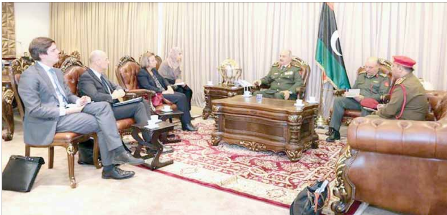
صورة وزعها مكتب حفر حفتر للقائه وفد الاتحاد الأوروبي بمقره في بنغازي أمس

الذي تقرر عام 2011، وكان وزير الخارجية الروسي سيرغي لافروف قد أعلن في مؤتمر صحفي عقب لقائه نظيره الليبي محمد سيالة في موسكو، أن بلاده «ستقوم بكل ما يلزم» لتسهيل التوصل إلى اتفاق بين طرفي النزاع في ليبيا من أجل إنهاء الأزمة السياسية في البلاد، عبر استضافة جولة جديدة من المحادثات بين الأطراف الليبية المقبلة. اعتبر محمد سيالة، وزير الخارجية بحكومة السراج، أنه يتعين على مجلس النواب الليبي أن يؤدي استحقاقات قانون الاستفتاء العام للدستور وقانون الانتخابات الرئاسية والبرلمانية قريباً، وقال إنه يتوقع أن تجري هذه الانتخابات منتصف العام المقبل. ودعا روسيا إلى إعادة فتح سفارتها المغلقة منذ نحو ثلاث سنوات في العاصمة طرابلس. إلى ذلك، من المقرر أن تشهد الجلسة المقبلة لمجلس النواب الليبي اختيار مرشح لشغل منصب محافظ البنك المركزي، من بين ثلاثة مرشحين، أبرزهم علي البحري المحافظ الحالي للبنك المركزي في مدينة البيضاء بشرق البلاد. ويوجد في ليبيا مصرفان مركزيان الأول في طرابلس يرأسه الصديق الكبير، ويعترف به المجتمع الدولي وتذهب إليه إيرادات النفط، والثاني في البيضاء شرق البلاد، بصفته المجتمع الدولي بـ«البنك المركزي الموازي»، وأيضاً الاعتراف به.