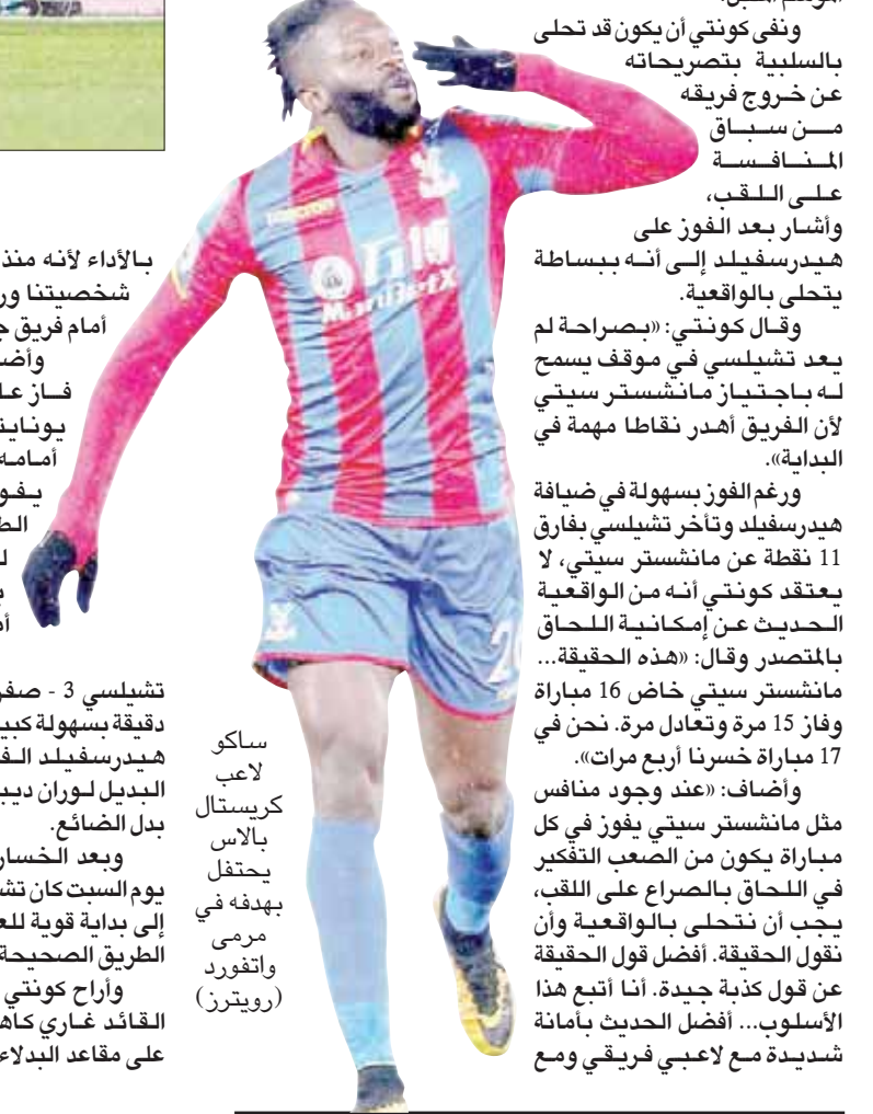
ساكو كريسيتال بالاس يحتفل بهدفه في مرمى وانفورد

وأضاف: «عند وجود منافس مثل مانشستر سيتي يفوز في كل مباراة يكون من الصعب التفكير في اللحاق بالصراع على اللقب، يجب أن نتحلى بالواقعية وأن نقول الحقيقة. أفضل قول الحقيقة عن قول كلمة جيدة. أنا أتبع هذا الأسلوب... أفضل الحديث بامانة شديدة مع لاعبي فريقتي ومع