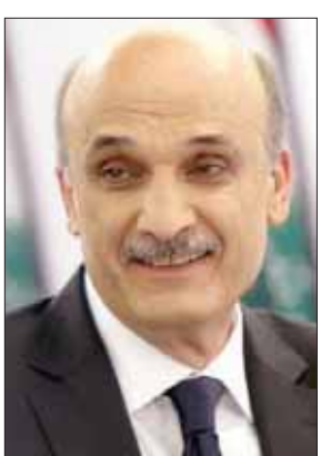
رئيس «القوات» سمير جعجع

شخصياً». وأضاف: «نحن والمستقبل لتتقي في السياسة حول مشروع واحد منذ ما قبل اغتيال الرئيس الشهيد رفيق الحريري، وبالتالي استمرار الرفقة السياسية مع المستقبل منوطاً بتمسك الرئيس الحريري بالثوابت الوطنية التي قامت عليها مسيرتنا (سواً)». وفيما فضل عدد من نواب «المستقبل» التزيت في التعليق على الموضوع والدخول بسجال بشأن العلاقة مع «القوات»