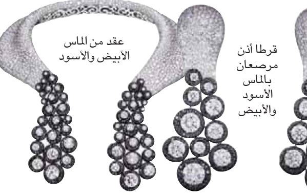
عقد من الماس الأبيض والأسود

في قمة السعادة عندما أستقبلهم والعب معهم. أحب أن أتابع تطورهم وأراقب كيف تتشكل شخصية كل واحد منهم في سن مبكرة. إنه شيء مثير للفضول