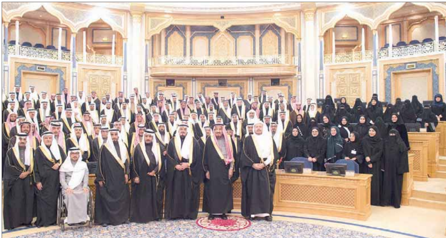
خادم الحرمين الشريفين الملك سلمان بن عبد العزيز في صورة تذكارية مع رئيس وأعضاء مجلس الشورى السعودي لدى افتتاحه أعمال السنة الثانية

مجلس الشورى ورؤساء اللجان من جانبه، قدم الشيخ الدكتور عبد الله آل الشيخ رئيس مجلس الشورى، خلال كلمته أمام خادم الحرمين الشريفين، رسداً عن أهم ما تم إنجازه في السنة الماضية، وهي السنة الأولى من الدورة السابعة للمجلس، مبدئاً أنه تم عقد 66 جلسة، كان نتاجها أكثر من مائتي قرار، ستة وعشرون منها تتعلق بالإنظمة واللوائح، وسبعة وستون قراراً تتعلق بالتقارير السنوية، في حين تتعلق ستة وتسعون قراراً بالاتفاقيات والمعاهدات ومذكرات التفاهم، كما درس المجلس كثيراً من الأنظمة واللوائح والمقترحات.