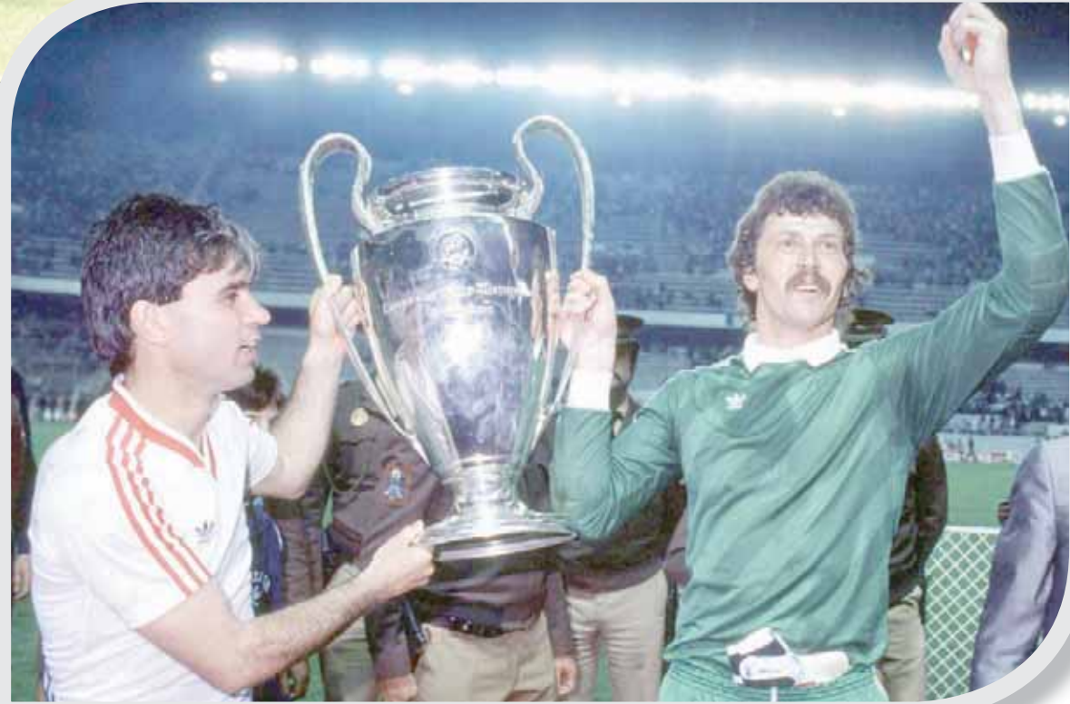
فريق ستيو بوخارست الذهبي في فترة الثمانينات خاض 119 مباراة من دون هزيمة وحصد كأس أبطال أوروبا

في أواخر ثمانينات القرن الماضي، كانت البلاد لا تزال تعاني من القبضة القاسية للطاغية السابق نيكولا تشاوشيسكو. وعليه، مرت الهيمنة الجبهة التي