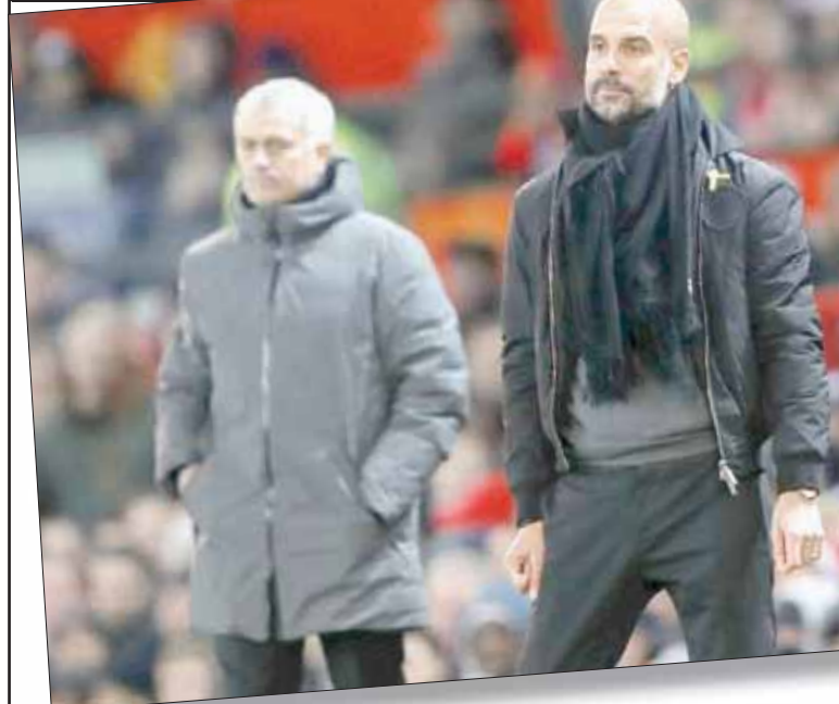
غوارديولا ومورينيو وصراع مستمر

نارية ضد مورينيو. وقال غوارديولا: «غدا في الساعة الثامنة و45 دقيقة سلتقي في الملعب، هو فاز خارج الملعب»، في إشارة إلى مورينيو. وأضاف: «الغد فاز طوال العام، طوال هذا الموسم وفي المستقبل، في هذا المجال هو المدير الداعم، إنه أكثر من يعرف العالم ولا أريد أن أنافسه في هذا ولو للحظة واحدة».