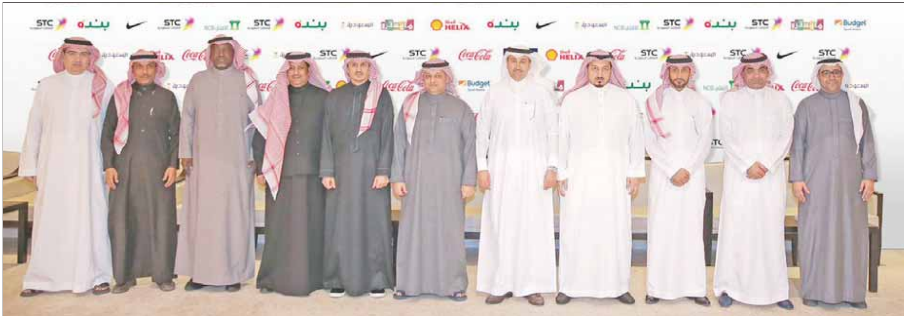
أعضاء مجلس إدارة اتحاد الكرة السعودي بعد نهاية اجتماعهم أمس

محاواة يقوم بتقديم استشارات للأندية الراغبة مجانية على حساب الاتحاد السعودي فيما يخص قضاياهم للأندية التي ترغب في ذلك.