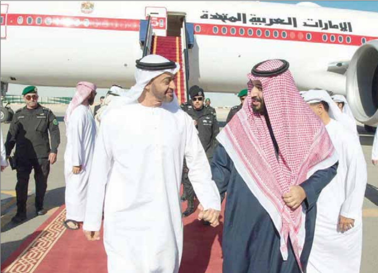
الأمير محمد بن سلمان ولي العهد السعودي لدى استقباله في المطار ولي عهد أبوظبي الشيخ محمد بن زايد

وأعرب عن ثقته بالدور الذي تقوم به السعودية في هذا الشأن بقيادة خادم الحرمين الشريفين في خدمة قضايا الأمة والمحافظة على مصالحها العليا وما أبدته من مواقف تاريخية وصلبة حيال المخططات التأميرية والإرهابية والأطماع الإقليمية التي تتعرض لها المنطقة. كما قال الشيخ محمد بن زايد إن الإمارات والسعودية تدرسان تماماً حساسية المرحلة، وحجم التحديات والمخاطر المحيطة بهذه المنطقة وبمستقبلها ومستقبل دولها وشعوبها، لذلك فإن المسؤولية التاريخية والمشاركة للبلدين تجاه المتغيرات والمستجدات قائمة على أرضية صلبة من التعاون والتفاهم والتآزر، وما التحالف العربي إلا أحد أوجه العمل الناجح الذي أسهم في وضع حد لتدهور المنظومة الأمنية للمنطقة. وكان ولي عهد أبوظبي وصل في وقت سابق إلى الرياض، أمس، واستقبله بقاعة الملك سلمان الجوية، الأمير محمد بن سلمان ولي العهد.