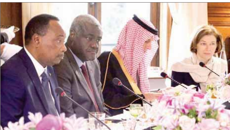
وزير الخارجية السعودي عادل الجبير يشارك في أعمال القمة

القوة المشتركة التي تحظى بدعم دولي من أن تعمل بشكل فعال وأن تستمر في عملها. من جانب آخر، يمكن عذ الإجماع على دعم ومساندة القوة الأفريقية التي قامت الشهر الماضي بأول عملية عسكرية ميدانية مشتركة. وإذا كانت باريس تقف في الصف الأول بسبب ماضيها الاستعماري وحضورها العسكري في منطقة الساحل حيث تنشر في إطار