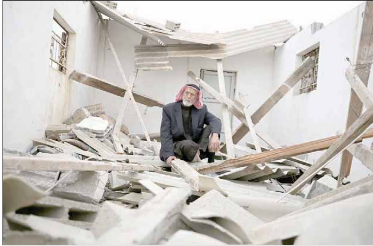
فلسطيني يجلس فوق أكوام الركام التي خلفها القصف الإسرائيلي على بعض مواقع حماس في خان يونس أمس (إبأ)

وأوضح غندلمان أن أفراد الخلية كانوا على اتصال بالفلسطينيين عبر عسيبة، أحد أعضاء الحركة، الذي «كان