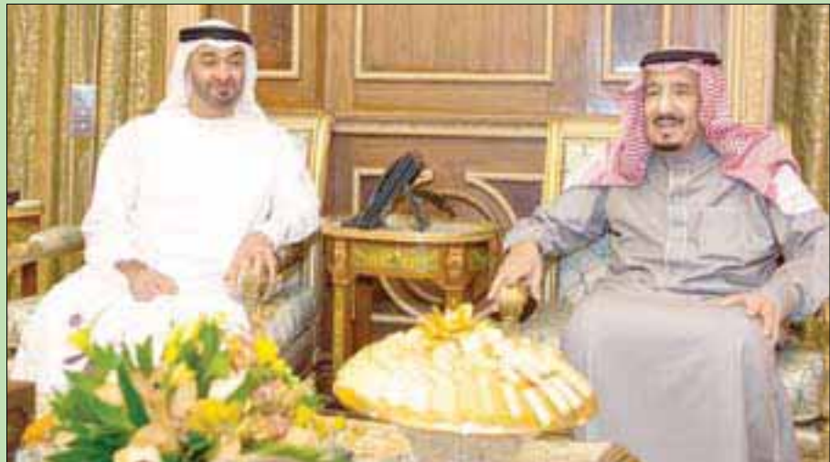
خادم الحرمين الشريفين لدى استقباله ولي عهد أبوظبي الشيخ محمد بن زايد في الرياض أمس (واس)

وتأجيج الفتن الطائفية وزعزعة الأمن والاستقرار الإقليميين، كما تسعى إلى ترسيخ قيم التسامح والتعايش، وتعمل على رفع المعاناة عن الشعوب». وثخن خادم الحرمين الشريفين دور القطاع الخاص باعتباره شريكاً مهماً في التنمية وداعماً للاقتصاد الوطني.