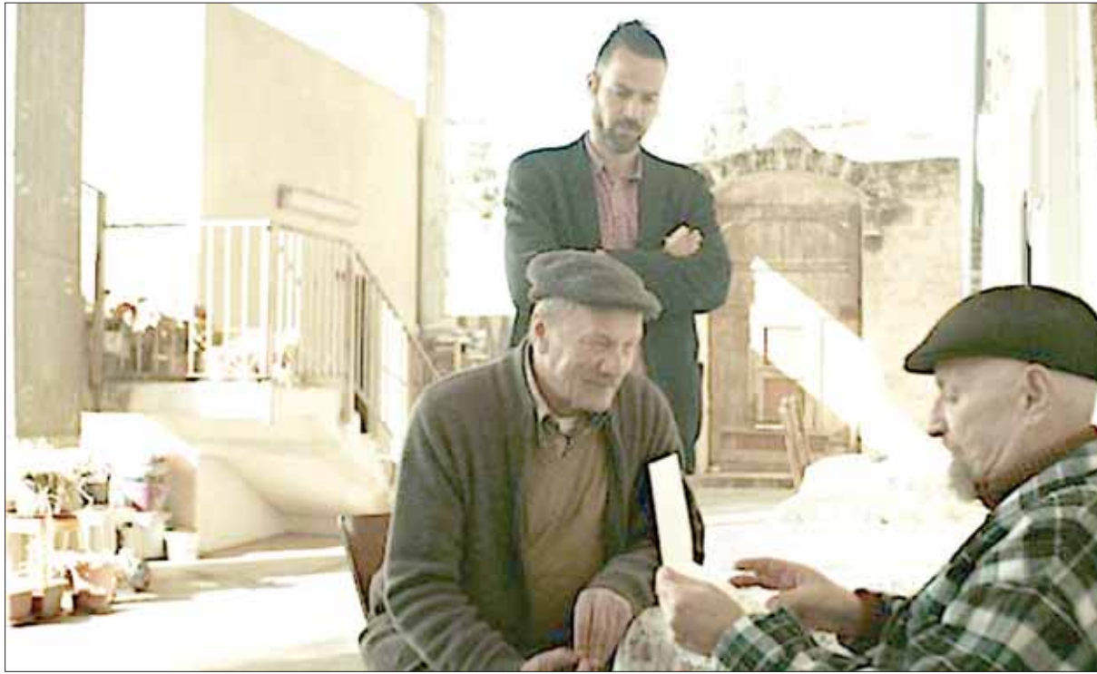
من فيلم «واجب» لماري أن جاسر