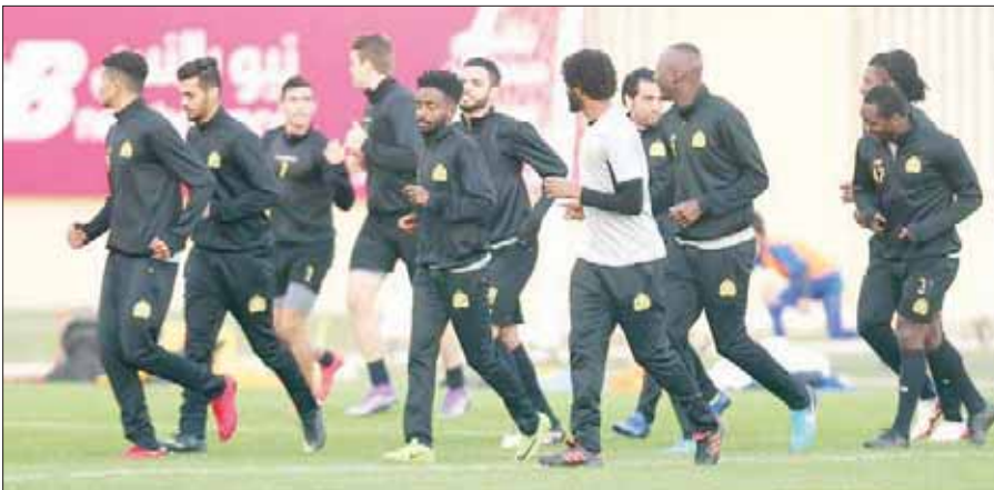
جانب من تدريبات النصر الأخيرة

من جانبه، يدخل الفيصالي هذا اللقاء باحثاً عن رد اعتباره أمام النصر الذي كسبه في مباراة الذهاب بخلافية نظيفة دون رد، ويعيش عنايب سير هذه الأيام نشوة فنية مميزة تحت قيادة مدربه الصربي فوك رازوفيتش، قادته لتحقيق نتائج إيجابية في المباريات الأخيرة وساهمت في حوله بالمرکز الرابع خلفاً للنصر بفارق نقطة بنقطة.