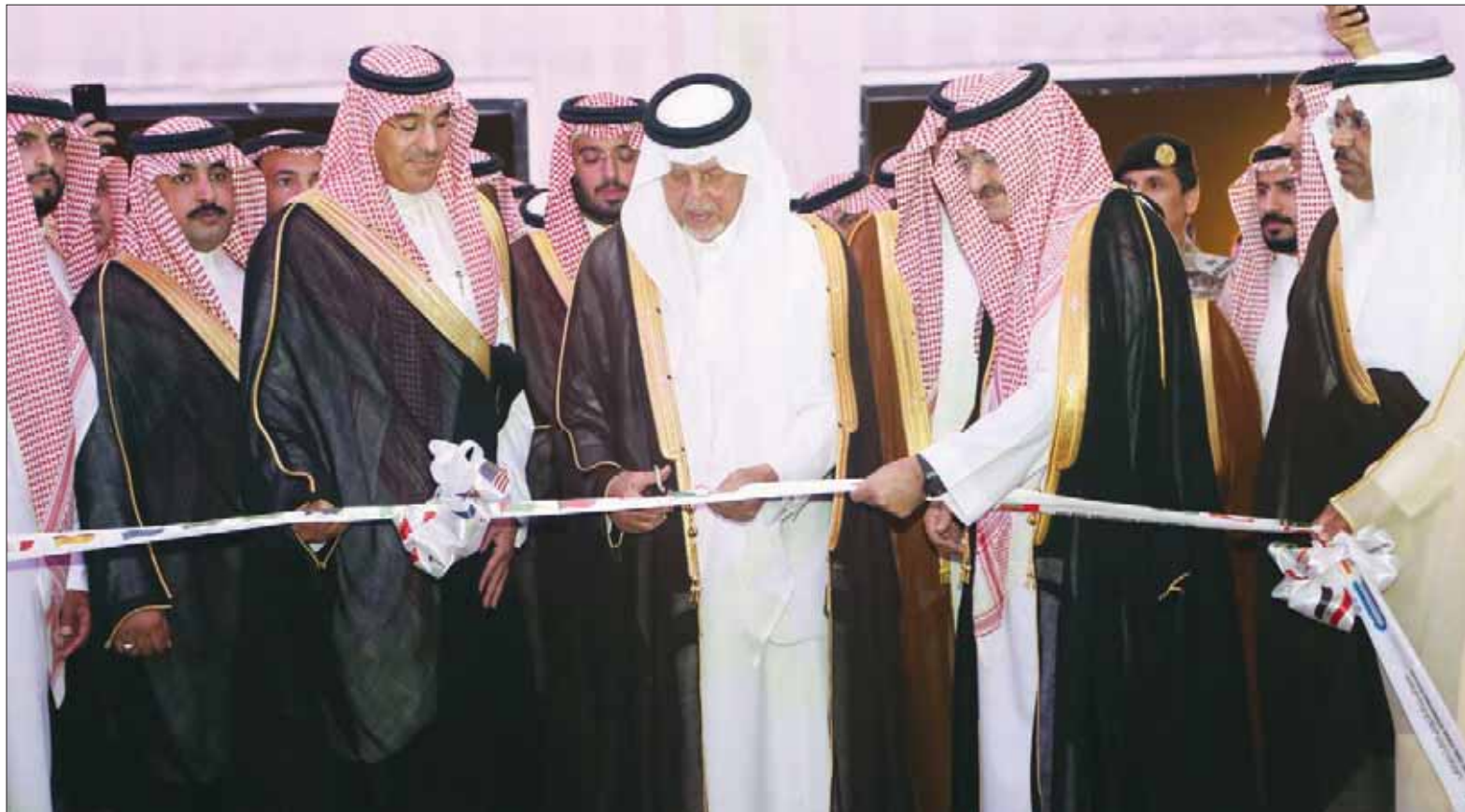
الأمير خالد الفيصل يفتتح معرض جدة للكتاب ويبدو الأمير مشعل بن ماجد محافظ جدة ود. عواد العواد وزير الثقافة والإعلام

المستوى الذي يرغبون فيه. وأضاف: «ندخل تحدياً كبيراً، ونحاول استقطاب أكبر قدر ممكن من الفعاليات المناسبة لهم حتى يتم دمجه في الجو العام للمعرض، وتتمنى أن تنجح فعاليات المعرض في