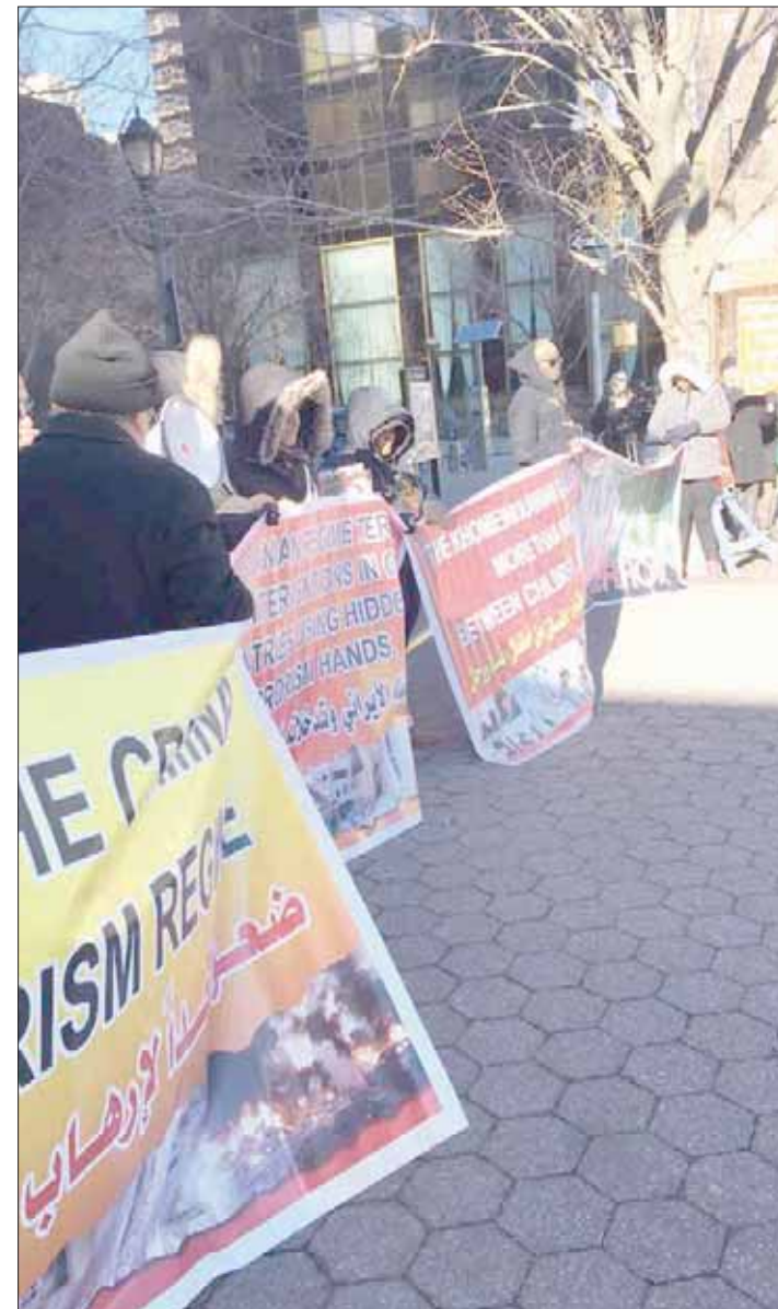
مظاهرات احتجاجية ضد انتهاكات حقوق الإنسان في إيران أمام مقر الأمم المتحدة بنيويورك أمس

وأضاف: «ينبغي سلوك النظام من أيديولوجيته المتطرفة التي تعتبر إيران طليعة الإسلام الشيعي في الشرق الأوسط، وتهيمن عليها الدول السننية وراعيتها الأميركية. وبهذا المعنى، تعتبر إيران المعارضة الداخلية شكلاً من أشكال التسلسل الثقافي الذي يسعى إلى تقويض شرعية النظام من الداخل، وهذه النظرة التامرية توجه أيضاً حملة عنادوية في جميع أنحاء الشرق الأوسط، والتي تسعى إلى إعادة تشكيل المنطقة السنية إلى حد كبير وفقاً للمذهب الشيعي»، وطالبت المنظمة الإدارية الأميركية في بيانها، بتعزيز مصالحها ضد النظام الإيراني عن طريق التشكيك في الأيديولوجية التي تحاكي سلوك طهران الخبيث في الساحات الأخرى، وتضامف الجهد الأميركي لمكافحة انتهاكات حقوق الإنسان في إيران، والتي اعتبرتها لا تفي بواجب إنساني فحسب، وإنما أيضاً مصلحة أمنية وطنية حيوية.