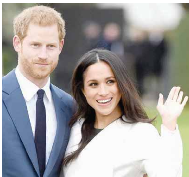
الأمير هاري وخطيبته ميغان ماركل

لندن، «الشرق الأوسط» فيما وصفه معلقون بأنه خروج على قواعد البروتوكول الملكي، ستنضم الممثلة الأميركية ميغان ماركل، خطيبة الأمير البريطاني هاري، إلى الملكة إليزابيث وغيرها من أفراد الأسرة المالكة في بريطانيا، خلال احتفالات أعياد الميلاد، حسب «رويترز». ويذكر أن الأمير هاري، حفيد الملكة إليزابيث والخامس في ترتيب ولاية العرش، وماركل إحدى بطلات المسلسل الدرامي القانوني «سوتس» قد كانت خطيبتهما الشهر الماضي، وسيقام حفل الزفاف في قلعة وندسور في مايو (أيار) المقبل. وعادة ما تقضي الملكة وأفراد أسرتها عطلة عيد الميلاد في ضيعة ساندرينغهام بشرق إنجلترا. وقال قصر بكنغهام إن الملكة وعددا من كبار أفراد الأسرة المالكة سيحضرون قداس عيد الميلاد في الكنيسة المحلية، مثلما جرت العادة منذ سنوات. لكن في خروج عن التقاليد المتبعة التي تنص على أنه يتعين على شركاء أفراد الأسرة المالكة الانتظار لما بعد الزواج كي يتم دعوتهم، قال قصر كينزنجتون إن ماركل ستنضم إلى خطيبها وشقيقه الأمير ويليام وزوجته كيت. وقالت متحدثة أمس الأربعاء: «من المتوقع أن تروا دوق ودوقة كامبريدج، والأمير هاري، والأنتسة ماركل، في ساندرينغهام يوم عيد الميلاد».