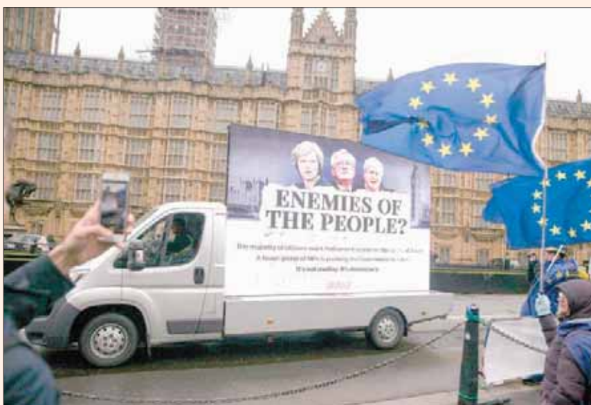
محتجون ضد خروج بريطانيا من الاتحاد الأوروبي يرفعون أمام البرلمان يافطة كتب عليها «أعداء الشعب» وعليها صور رئيسة الوزراء ووزير الخارجية ووزير «بريكست»

بروكسل، عبد الله مصطفى صوت البرلمان الأوروبي، أمس، لصالح مقترح يعترف بأن محادثات «بريكست» بين لندن وبروكسل قطعت شوطاً كافياً، وذلك بتأييد 556 صوتاً ومعارضة 62 صوتاً. إلا أن التصويت غير مُلزم، لكن يتعين على البرلمان الأوروبي التصديق على أي اتفاق يتم التوصل إليه بشأن خروج بريطانيا، وحث البرلمان الأوروبي قادة الاتحاد الأوروبي على إعلان «بداية المرحلة الثانية» من مفاوضات خروج بريطانيا من التكتل. ويرى البريطانيون أن الاتفاق بين بروكسل ولندن، الذي ما زال يعتبر أولياً ومبدئياً، يهول الطرفين للمرور إلى مرحلة ثانية تتم فيها مناقشة المرحلة الانتقالية والشراكة المستقبلية بين الطرفين. ومن وجهة نظر العديد من المراقبين في بروكسل، تعتبر موافقة البرلمان الأوروبي على نص اتفاق الجمعة الماضي مهمة، إذ إن الجهاز التشريعي الأوروبي يدعم بذلك موقف الوفد التفاوضي الأوروبي أمام زعماء الدول، الذي سيجتمعون اليوم الخميس ولمدة يومين في بروكسل ويمتلكون وحدهم حق إعطاء الضوء الأخضر للتقدم في المفاوضات مع لندن. وقال رئيس البرلمان الأوروبي، أنتونيو تاجاني، إن قرار البرلمان بشأن ملف خروج بريطانيا، أشار إلى «إحراز تقدم كاف في المفاوضات، وهذه خطوة مهمة إلى الأمام، وستتيح لنا الانتقال إلى المرحلة الثانية»، وأضاف أن الدول الأعضاء الـ27 أظهرت الوحدة والشفافية في هذه المرحلة الأولى الحساسة. وقدم الشكر إلى كل من رئيس الفريق التفاوضي الأوروبي ميشال بارنييه وأيضاً رئيسة الوزراء البريطانية تريزا ماي.