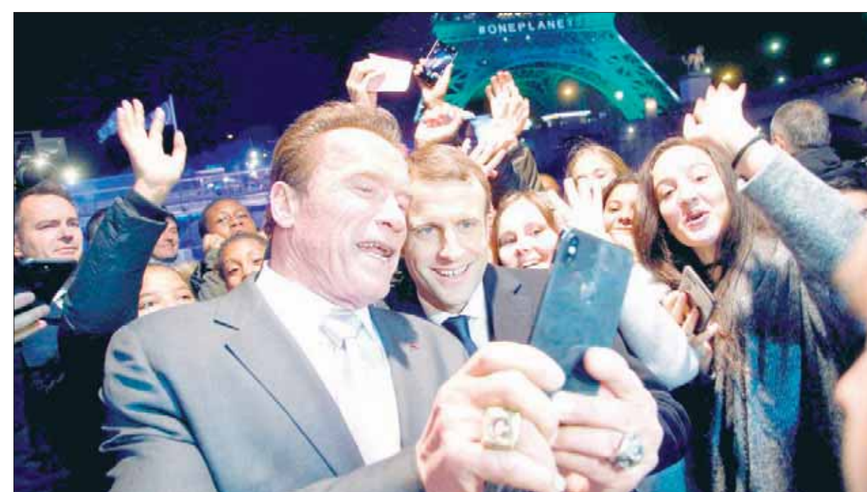
سيلفي لحاكم كاليفورنيا السابق الممثل أرنولد شوارزنيغر مع الرئيس الفرنسي إيمانويل ماكرون ونشطاء في قمة «كوكب واحد» في باريس

البيئية التي تهدد الأرض «البيست» موزعة بالتساوي» بين البلدان الغنية والمصنعية وبين البلدان الفقيرة وفي طور النمو. وثمة توافق مبدئي على أن تقوم الدول الغنية بمساعدة الدول النامية على السير نحو ما يسمى «الاقتصاد الأخضر» أي غير المتسبب بانبعاثات غازات الاحتباس الحراري. ومما اتفق عليه أن توفر الدول الغنية 100 مليار دولار سنوياً للدول في طور النمو بدءاً من العام 2020 والحال أنه حتى الآن، لم تتبين بعد الطريقة التي سيتم بموجبها جمع هذه المبالغ. لذا، فإن الإعلان في المؤتمر عن الالتزام بتوفير 300 مليون دولار لمحاربة التصحر بدأ ضعيفاً لمواجهة الحوارات الاقتصادية والاجتماعية والسياسية المتأنية عن تسارع التصحر في الكثير من البلدان الأفريقية. وفيما تشكو البلدان الأوروبية من ظاهرة الهجرة ومن تآثيراتها في الداخل الأوروبي، فإن تقاعس الدول الغنية عن الوفاء بالتزاماتها المالية سيؤدي من صعوبات البلدان المتأثرة بالتصحر وبالتالي من المهاجرين. وبقيت في الأذهان كلمة الأمين العام للأمم المتحدة أنطوني غوتيريش الذي أعلن أن التغيير المناخي «يهدد مستقبل قدرة البشر على العيش في كوكب