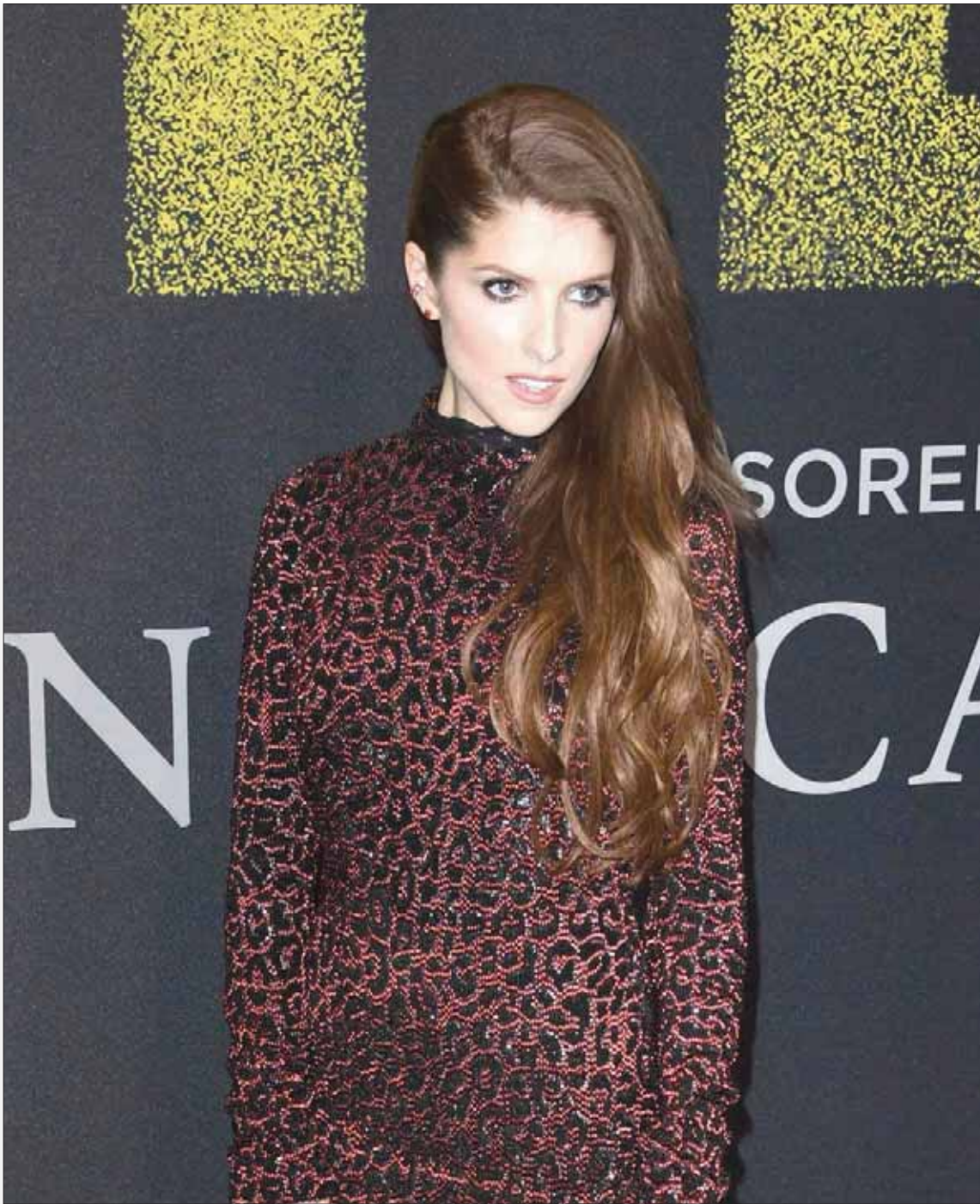
المثلة الأميركية آنا كندريك تصل إلى العرض الأول لفيلم «بيتش بيرفيكت 3» بمسرح «دولبي» في هوليوود بكاليفورنيا