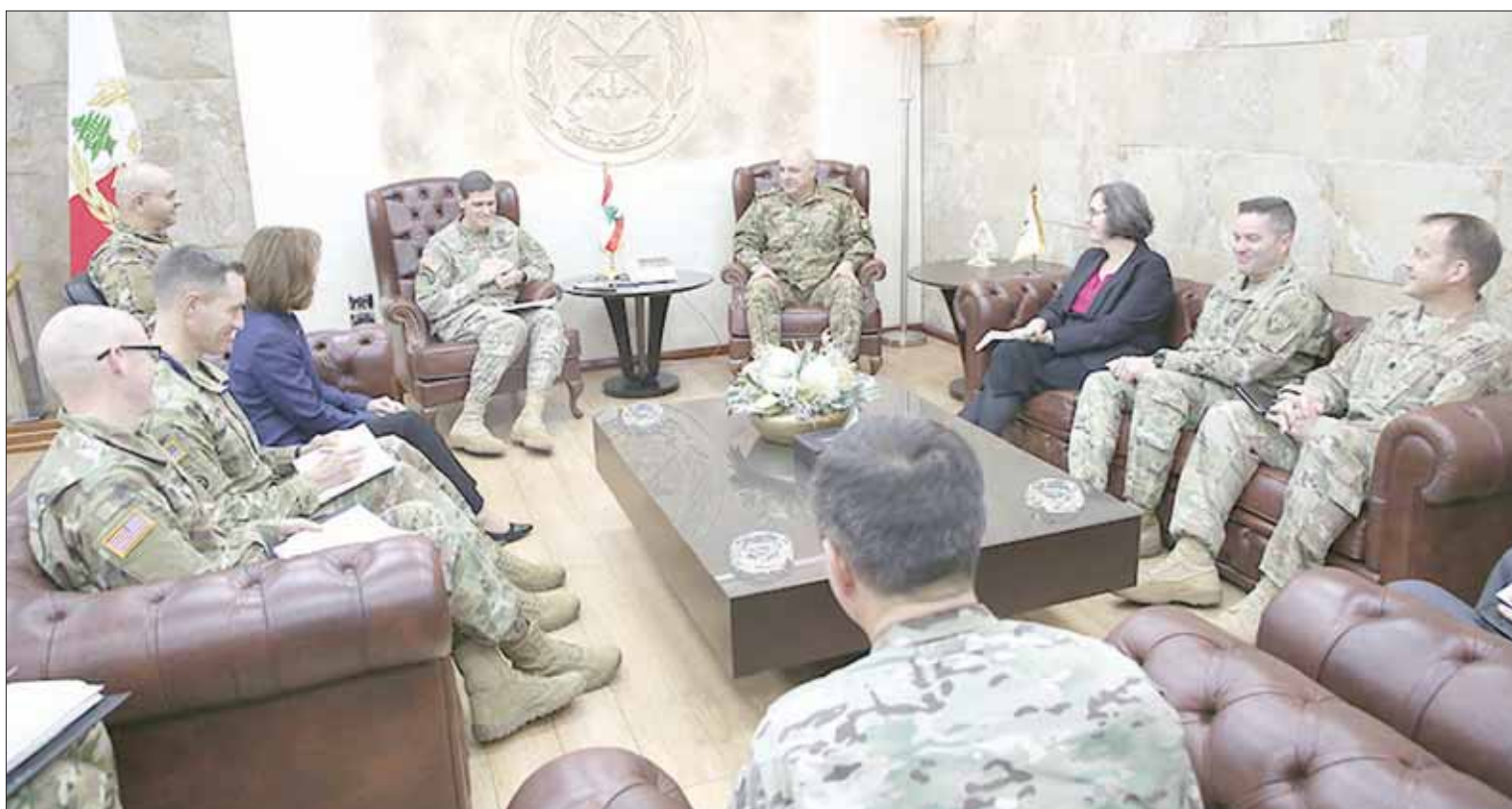
قائد المنطقة الوسطى في الجيش الأميركي الجنرال جوزيف فوتيل مع قائد الجيش اللبناني جوزيف عون في بيروت أمس

رفعت الولايات المتحدة الأميركية مستوى الدعم العسكري للجيش اللبناني، على صعيد الأسلحة النوعية وحجم المساعدة، حيث أعلنت أمس عن تزويده بانظمة تقدر قيمتها بأكثر من مائة وعشرين مليون دولار، وتشمل ست طائرات هليكوبتر هجومية خفيفة من طراز MD 530G، وأسلحة أخرى تستساعد الجيش في البناء على قدراته الثابتة والقوية من أجل القيام بعمليات حماية الحدود ومكافحة الإرهاب». وتعد الحزمة الجديدة من المساعدات الأكبر من حيث قيمتها وتقديمها دفعة واحدة، كما أن طائرات الهليكوبتر الهجومية الأميركية، هي الأولى التي ستدخل ترسانة سلاح الجو اللبناني، الذي فدته واشطن في وقت سابق من هذا العام بطائرات سوبر توكانو، في مسعى لتمكين سلاح الجو اللبناني وتعزيزه بحسب ما ذكر بيان أصدرته القيادة الجيش». يذكر أن الجيش دفع بتعزيزات إضافية قبل شهرين على حجم مساعداتها للجيش اللبناني، بيمثل 40 مليون دولار لإضافة خلال الزيارة الأخيرة لقائد الجيش العماد جوزيف عون إلى واشطن، مشيرة إلى أن الـ40 مليون دولار «ضيفت إلى قيمة المساعدات التي كانت مخصصة للجيش، وهي الآن تُضم إلى