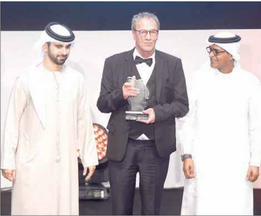
الممثل الفلسطيني محمد بكري يتسلم جائزة عن دوره في فيلم «واجب»

التنريف الأوسط في مهرجان دبي السينمائي الدولي (7)