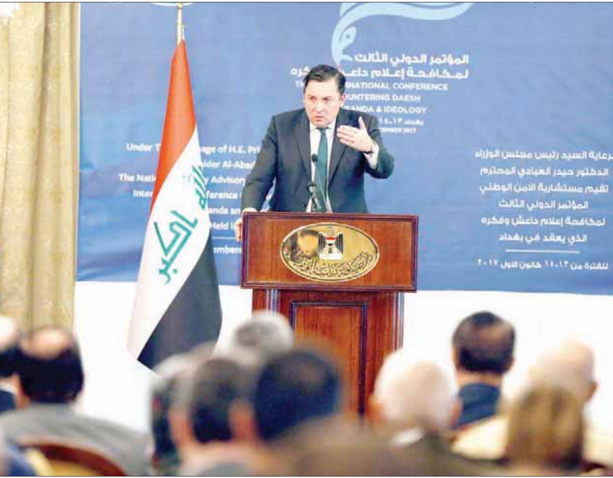
السفير البريطاني لدى العراق جون ويلكس خلال مشاركته في مؤتمر مكافحة «داعش» إعلامياً وفكرياً

الف نازح في معسكرات للنزوح في بغداد. إلى ذلك، أكد تقيب الصحفيين العرب مؤيد السلمي أن «نقابة الصحفيين، وبالتعاون مع جهات داخلية وخارجية إعلامية وأفكارية، ستعمل على وآد الفكر المتطرف الذي أنتج (داعش) ومكنه من احتلال محافظات عراقية عدة، وما تركه ذلك من آثار ديميرية ليس على مستوى البنية التحتية (فقط)، بل على مستوى الفكر والخطاب، وهو من وجهة نظرها أخطر من التخريب في المدن». وأضاف السلمي أن «تنظيم داعش توغل خلال سنوات من احتلاله المحافظات الغربية بين السكان وأبناء مدارس، وهيمن على المساجد، وطبع كتباً ومناهج وأدار الأمور هناك طوال هذه السنوات، وهو ما يعني أنه ترك بشكل أو بآخر تأثيرات على أنماط معينة من المجتمع هناك، لا سيما فئة الشباب والنساء تقريباً والأطفال»، لافتاً إلى أن «هذه الفئات هي الأخطر في المجتمع وهي التي تحتاج إلى معالجة أكثر من سواها». وقال، «لكني نكون عمليين في هذا السياق، فإننا سنعمل على إعداد فرق عمل بحثية أكاديمية متعددة الاختصاصات وسنأخذ بعيننا من المظاهر الذي أحدثته فيها، لكي نتمكن من تحديد الدلائل الصحيحة عند إعطاء العلاجات اللازمة». وأكد أن «مخرجات هذا المؤتمر وسواء من الندوات والحلقات الدراسية ستتحول إلى ورشات عمل منتجة في نقابة الصحفيين وبالتعاون مع الاختصاصيين والإكاديميين، بالإضافة إلى استعانتنا بعدد كبير من الصحفيين العراقيين من أبناء تلك المناطق لكي يكون لدينا دليل عمل واضح في مواجهة هذا الفكر وقطع الطريق أمامه في إمكانية إحداث أي تأثير مستقبلية».