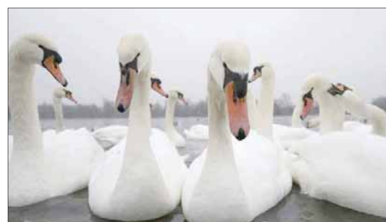
طيور البجع الملكي