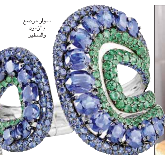
سوار مرصع بالزمرد والسفير

إذا كان هناك شيء لا يمكنني الاستغناء عنه في الحياة فهو العمل. لا أتوقف عن نفسي متقاعدا أو متوقفا عن البحث والابتكار. فانا أستيقظ مبكرا، أينما وجدت، لأبدأ العمل مباشرة. عادة ما تكون لدي لقاءات عمل وارتباطات عشاء وأحيانا حضور حفل في المساء. نظرا لهذا البرنامج المكثف طوال السنة، أقد أشد التقدير تلك اللحظات التي أقضيها في