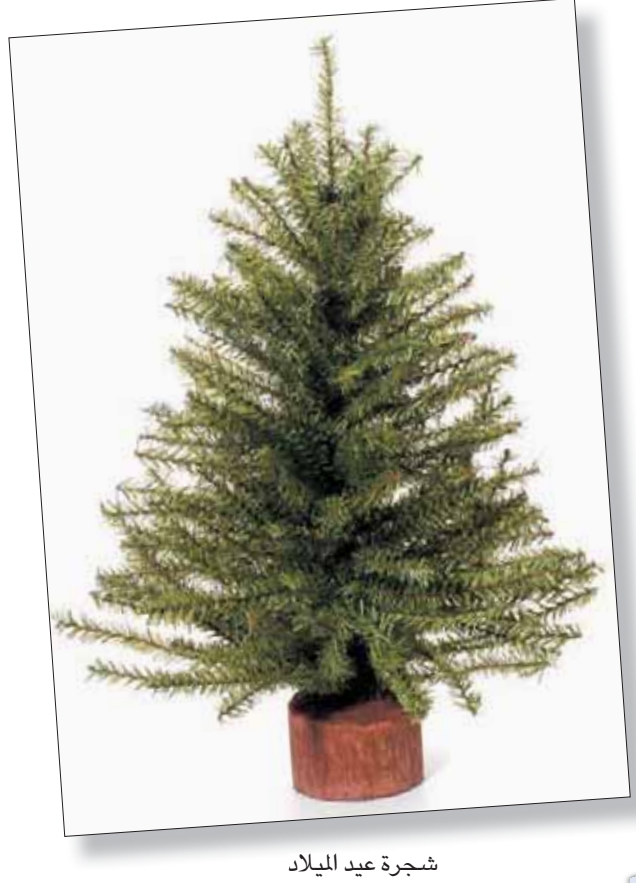
شجرة عيد الميلاد

ويبين وزير الثقافة والإعلام أن جوانب الثقافة ومجالاتها متعددة، فمنها الشكل اللغوي المتمثل في الأدب واللغة وما يزرخان به من شعر ونثر، ومنها الفنون وما تشتمل عليه من مسرح وفنون جميلة وتشكيلية وتصويرية، ومن فنون أدائية تتمثل في الموسيقى