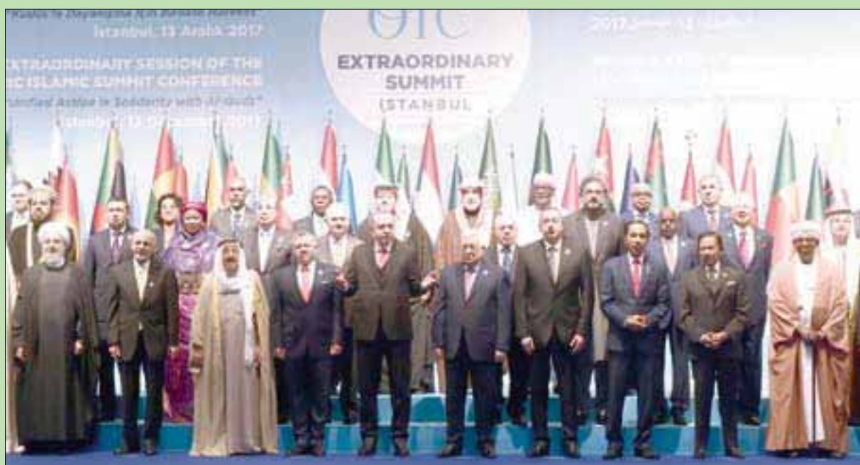
قادة وممثلو الدول الإسلامية في القمة الاستثنائية لمنظمة التعاون الإسلامي بإسطنبول أمس

الثاني، من أن «محاويات تهويد القدس ستفجر العنف». وشدد على أن الاعتراف الأميركي بالقدس عاصمة لإسرائيل «يهدد الأمن والاستقرار في المنطقة». من جانبه، دعا الأمين العام لمنظمة التعاون الإسلامي يوسف بن أحمد العثيمين، دول العالم التي لم تعترف بعد بدولة فلسطين إلى أن تتبادر بالاعتراف بها. بدوره، قال الرئيس التركي رجب طيب أردوغان، في مؤتمر صحفي مشترك مع العثيمين وعباس، عقب القمة، إن القدس هي عاصمة دولة فلسطين من الآن فصاعداً، وستبقى كذلك وأضاف أردوغان، الذي ترأس بلاده الدورة الحامسة للقمة الإسلامية، أن «القمة تعدّ بمثابة رسالة تاريخية بالنسبة لإثبات كارثية الخطوة الاستثنائية التي اتخذتها الإدارة الأميركية».