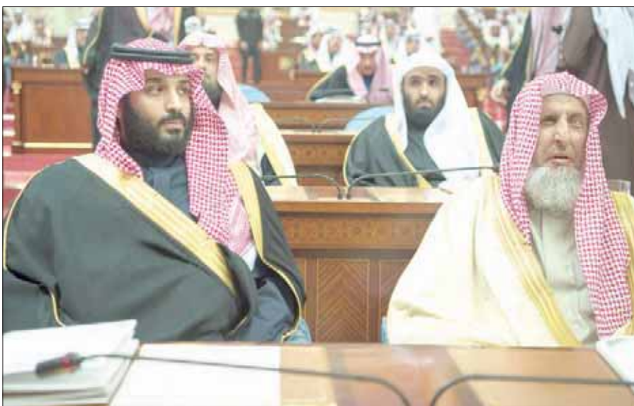
الأمير محمد بن سلمان ولي العهد وإلى جانبه الشيخ عبد العزيز آل الشيخ مفتي عام المملكة

أيتها الإخوة والأخوات: لما تحمله (رؤية المملكة 2030) من خطط وبرامج تنموية تستهدف إعداد المواطنين والكوادر البشرية في مختلف المستويات وفي مختلف مواقع المسؤولية في القطاع العام والخاص، وكذلك المهتمين بها من عاملين ومستثمرين، الذين نعتز ونفخر بهم ونشدد على أيديهم وتمننى لهم التوفيق.