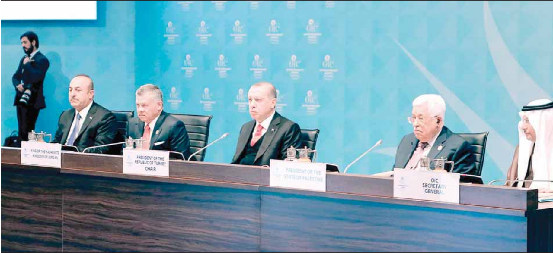
الرئيس التركي رجب إردوغان يتوسط الملك عبد الله الثاني والرئيس محمود عباس خلال قمة إسطنبول أمس

أنقرة، سعيد عبد الرازق رام الله، كفاح زيون