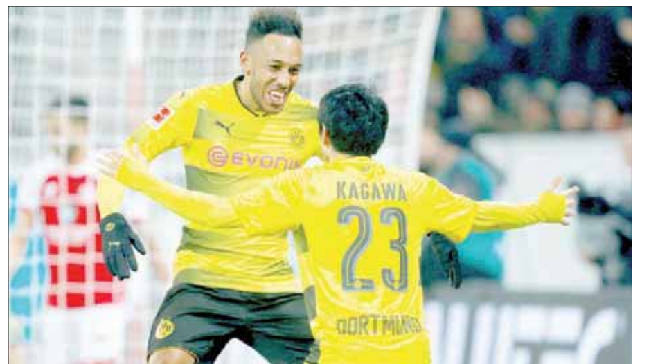
نجم دورتموند كاغاوا وأوبامانغ يحتفلان بالفوز على ماينز

واستقبل مورينيو كلمات غوارديولا ببعض الاستخفاف والسخرية، حيث قال: «أنا لست هنا لكي أعلق على كلماته، الشيء الوحيد الذي يمكنني أن أقوله هو أن الأمر بدأ لي مختلفا، هناك اختلاف في التصرفات وفي الأخلاق، هذا كل شيء».