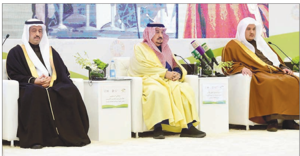
الأمير فيصل بن بندر والشيخ خالد المحيسن رئيس الهيئة الوطنية لمكافحة الفساد بالسعودية

وتطرق رئيس الهيئة الوطنية لمكافحة الفساد بالسعودية إلى أن عقد في مجال تعزيز النزاهة، ويسلط الضوء على ممارسات النزاهة في مؤسسات العدالة الجنائية.