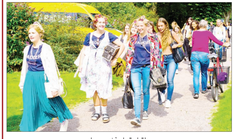
طلبات الجامعة في حرمها

بعد 40 دقيقة من كوبنهاغن، وفي لوند يمتزج ألف عام من التاريخ بروح شباب البلد، والشركات العلمية، والمنشآت البحثية العلمية. تركز جامعة «لوند» بشكل خاص على توظيف الطلبة، وتقدم برامج ودورات تدريبية بالتعاون مع شركات ومؤسسات محلية وعالمية. وتعد جزءاً من منطقة مالو، وهي رابع أهم منطقة في مجال الاختراع والإبتكار على مستوى العالم، حيث توجد بها مجموعة متنوعة من الشركات التي تتمتع بقدرة كبير من العلم والمعرفة. ومن تلك الشركات الشهيرة، التي تتعاون معها الجامعة، شركة «أريكسون»،