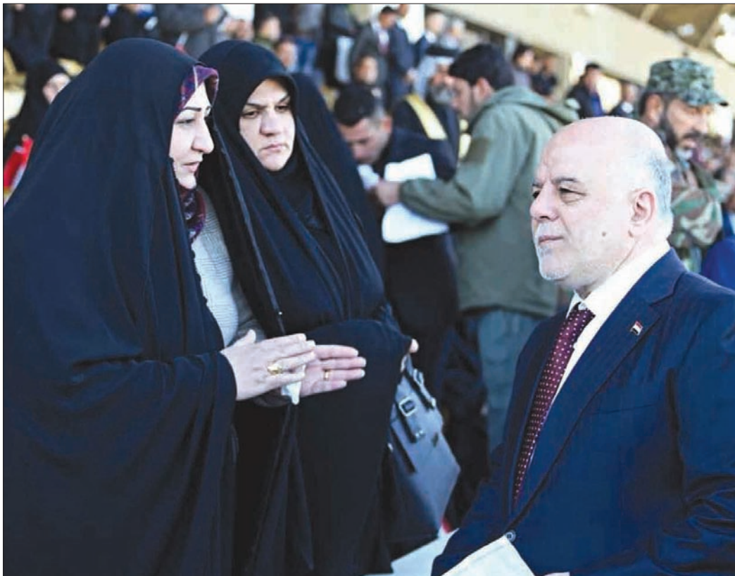
العبادي يتحدث إلى نساء فقدن أقرباء لهن في الحرب ضد «داعش» خلال العرض العسكري الذي أقيم في بغداد أمس

وكان بين الحاضرين نسوة متشحات بالسواد مع أطفالهن، بعضهم يحمل صور أقرباء لهن قُتلوا في المارك. وفي خطاب رسمي أول من أمس (السبت)، أعلن رئيس الوزراء العراقي من أمام مقر وزارة الدفاع في بغداد،