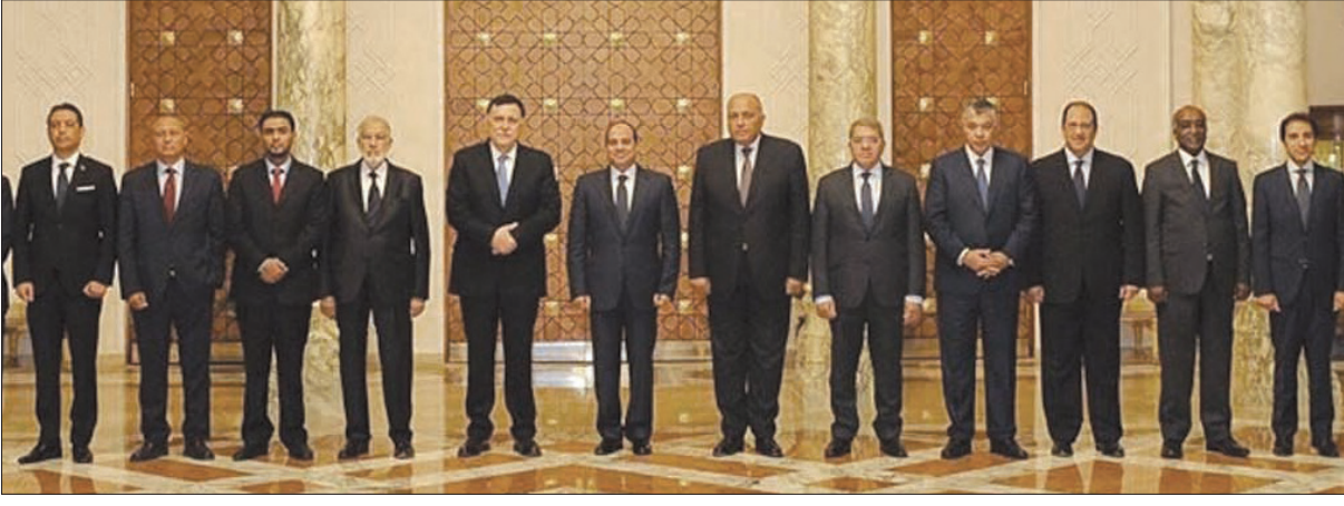
السيسي خلال استقباله السراج أمس في القاهرة