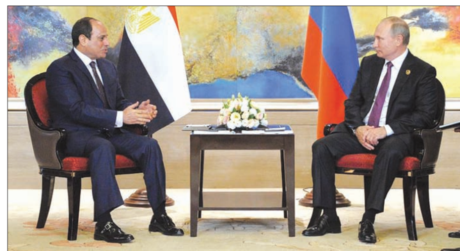
السيسي في لقاء سابق مع بوتين

المصرية، وعززت تصريحات أدلى بها وزير الخارجية سامح شكري، أمس، لفتاة «روسيا اليوم» من احتمالية توقيع العقود بين الحكومة المصرية والشركة الروسية «روس اتوم»، إذ قال إن «هناك تطورات كبيرة واستمرار البحث في كل المجالات المرتبطة بهذا المشروع القومي المهم (المحطة النووية) لأنه مشعب بنواح كثيرة متصلة بالتصميم والنواحي القانونية