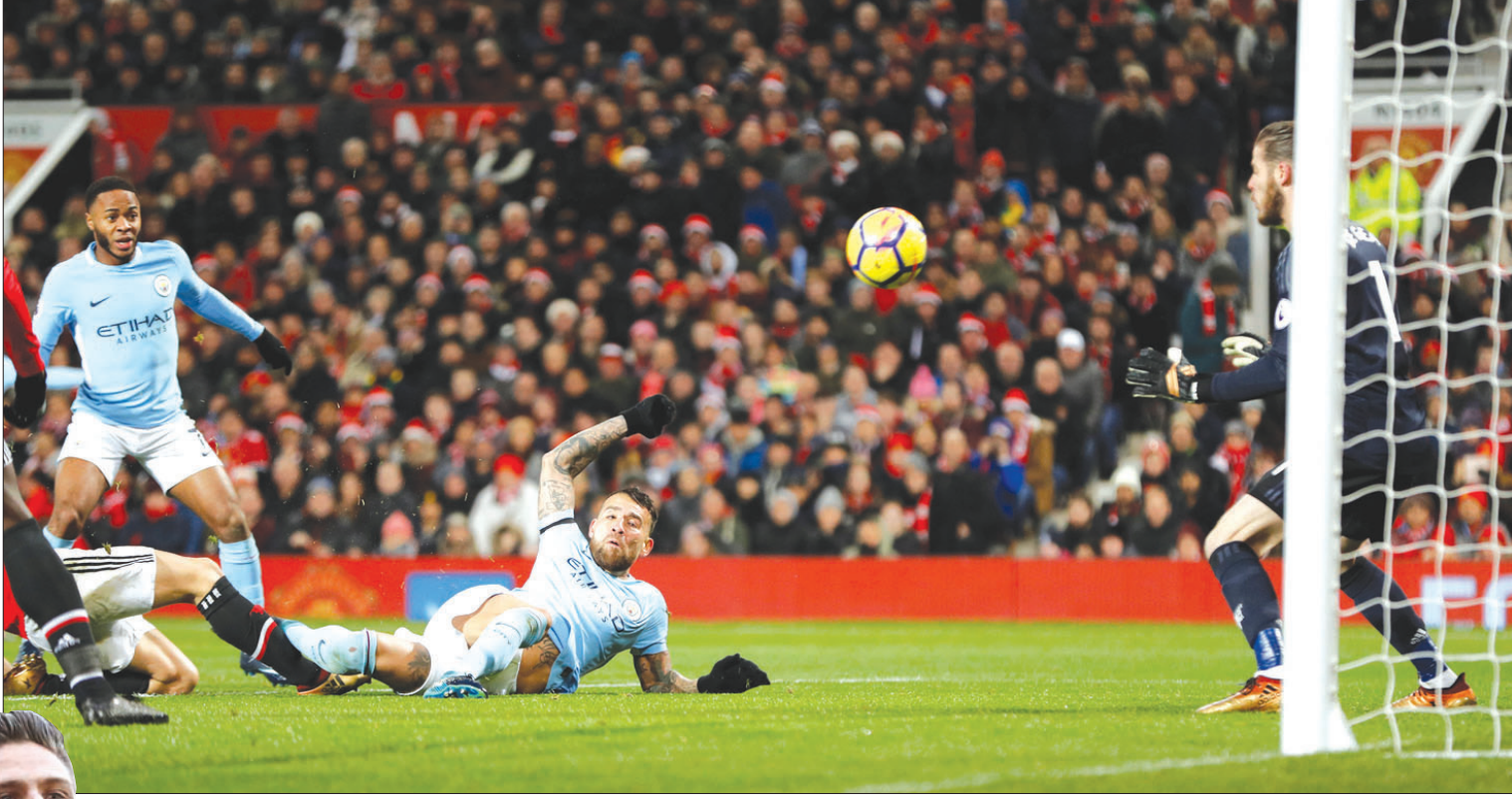
أوتامبدي لاعب مانشستر سيتي يسجل هدف فريقه الثاني في مرمى يونائيد

والأهم من ذلك، أنه جنب فريقه ومديره فينغر هزيمة محرجه أخرى، لا سيما أنه كان يواجه فريقاً لم يحقق سوى فوز وحيد في المراحل السبع الأخيرة.