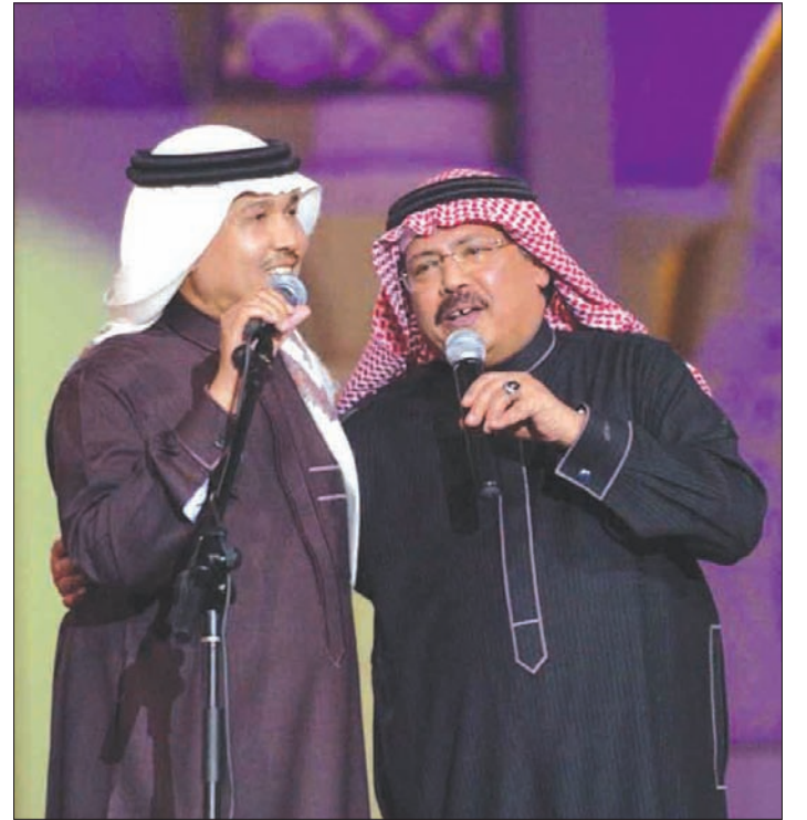
الراحل متوسطاً بينه أصيل والفنان عبد الله الرويشد

انتقاله في الثمانينات إلى منزله في الروضة، حضوراً كبيراً لجلسه الأدبي الذي كان يعقده بوجود كبار الشخصيات السياسية والفرق الرياضية والفنية. وتبقى الرياض هي المدينة التي عشقها الراحل، فيها، وغنى للسعودية عدداً من الأغانى مثل: «يا مسافر على الطائف»، «والإمك في الرياض»، «وبرج الرياض»، «يا بلادي وأصلي»، كما غنى لكل من الملكين خالد بن عبد العزيز وفهد بن عبد العزيز. وبعد الظهور الملحوظ لنجم أبو بكر على مستوى الجزيرة العربية، بدأت رحلاته المكوكية بين جدة وبيروت، التي سجل فيها مجموعة أسطوانات، وقدم بعدها العديد من الألوان مثل اللون الحضرمي والدان الحضرمي من شاعر حضر موت حسين أبو بكر المحضار وشعراء وملحنين آخرين. وظل اللون الحضرمي الخاص والمفضل لأبو بكر سالم، وشهدت فترة استقراره بالعاصمة الرياض بداية في حي السليمانية، ثم