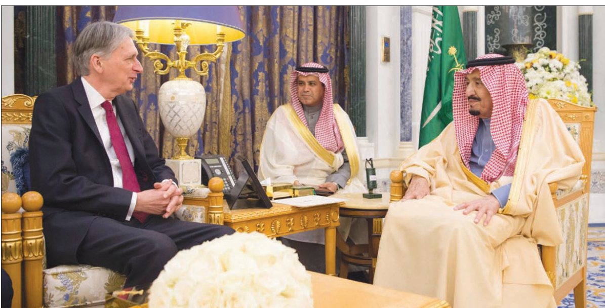
خادم الحرمين الشريفين الملك سلمان بن عبد العزيز لدى استقباله وزير الخزانة البريطاني في الرياض أمس (واس)

المسؤولة، نالت شركة «الحفر العربية» المركز الأول، فيما حلت شركة «التعددين العربية السعودية» (معادن) بالمركز الثاني، وتقاسم المركز الثالث بالمناصفة كل من شركة «الشرق الأوسط لصناعة وإنتاج الورق» (ميكو) وشركة «سبيشال دايركشن».