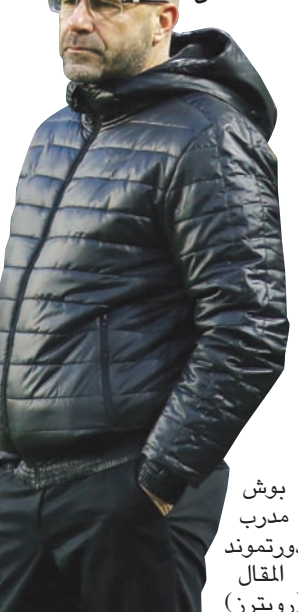
برلين، «الشرق الأوسط»

لترتيبها في مجموعاتها بالدور الأول، حيث وضع المتصرون ضمن المستوى الأول، فيما حل أصحاب المركز الثاني في المستوى الثاني، وتعيد مشاركة خمسة أندية إنجليزية بدور الـ 16 (رقم قياسي) للأذهان