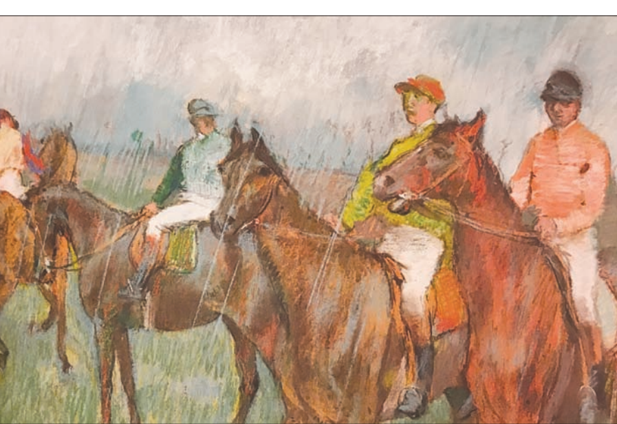
إحدى اللوحات المعروضة

كان ديغا شغوفا بحضور عروض البالية، مثل غيره من الباريسيين في ذلك الوقت، عام 1885 فقط حضر 54 عرضاً للبالية، فقد كان يبنه قريبا من مقتنيات متحف بيريل.