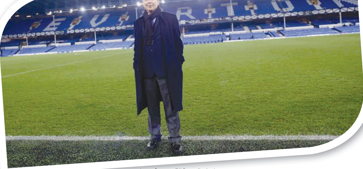
موشيري امتلك الحصة الأكبر من أسهم إيفرتون

ويبدو أن «إبلي» شعرت ببعض الارتباك في التعرف على مدى الانفصال بين أموال موشيري وعثمانوف، وتشير الوثائق إلى أن القسم المعني بضمان الالتزام بالقوانين داخل الشركة شرح مصدر ثروة موشيري عام 2007 بالإشارة إلى أن رجل الأعمال تلقى «هدية» من عثمانوف. وأضافت الوثائق: «إنها أرباح من (غالاهر هولدينغز) - كانت تشكل في هذا