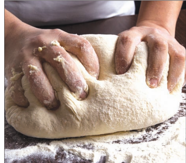
خبز خاص لرواد الفضاء

مختلفا»، مشيرا إلى حاسة التذوق المتبلدة لدى رواد الفضاء والتي تدفعهم إلى المطالبة بتناول بعض المأكولات المتبلدة مثل النقانق الساخنة. وسيكون خبز الفضاء مصمما بحيث يظل صالحا نصف عام على الأقل نظرا لطول الفترات ما بين عمليات إعادة التزود بالإمدادات إلى المحطة الفضائية الدولية. ولا بد أيضا أن تكون الفانغ شبيهة وانعامة رغم القيود المفروضة على الكهراء المستخدمة لتشغيل أفران التسخين وغيرها من القيود. ورغم أن الأفران تعتبر من