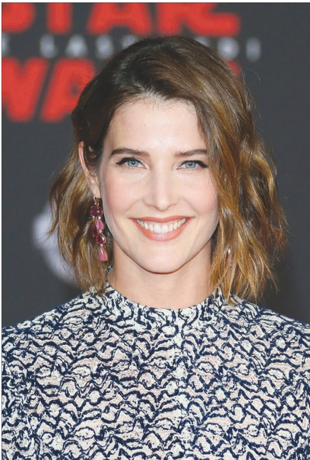
المثلة الكندية كوبي سمولدرن أثناء حضورها العرض الأول لفيلم «حرب النجوم: آخر جيدياي» في لوس أنجلوس