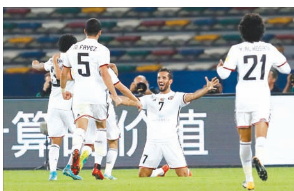
الجزيرة الإماراتي أمامه مهمة صعبة في نصف نهائي مونديال الأندية

أكبر في النهائي الآسيوي؛ لكنه افتقر للفاعلية، على عكس الجزيرة الذي عرف الطريق للشباك في مباراتين من أضيق الطرق. وقال الهولندي تين كات