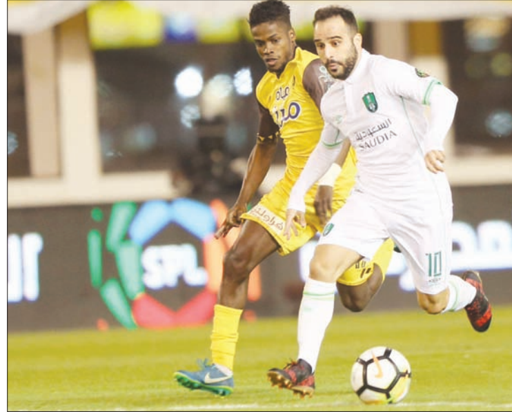
جانب من مواجهة أحد والأهلي في المدينة المنورة أمس («الشرق الأوسط»)