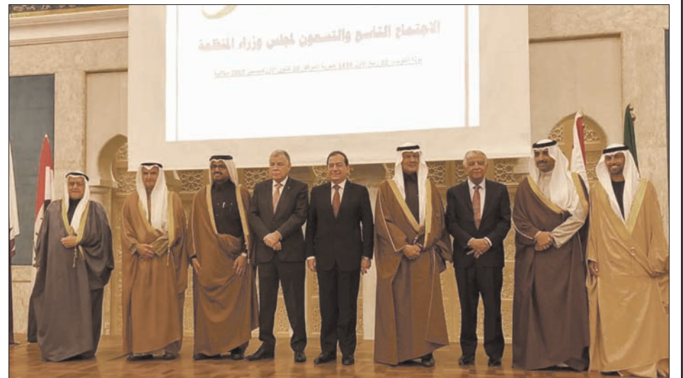
رئيس الوفد السعودي في اجتماع «أوبك» الأمير عبد العزيز بن سلمان بين الوزراء العرب

الدورة الحالية لمجلس وزراء المنظمة. واستعرض المشاركون نشاطات الأمانة العامة لعام 2017، ومنها المؤتمرات والندوات والاجتماعات التي عقدتها أو شاركت فيها، بما في ذلك الإعداد والتحضير لمؤتمر الطاقة العربي الحادي العاشر الذي سيعقد العام المقبل، وكذلك ما أعدته من دراسات فنية واقتصادية، إضافة إلى متابعة شؤون البيئة والمفاوضات المتعلقة بخطوات اتفاقية الأمم المتحدة الإطارية لتغير المناخ. كما كرم مجلس وزراء