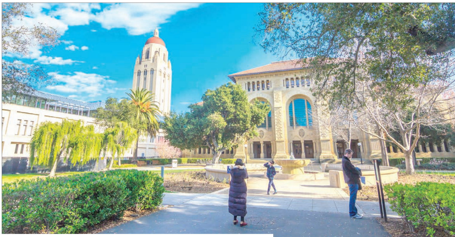
حرم جامعة ستانفورد

هذه الجامعة في المرتبة السابعة، من أقدم الجامعات في الولايات المتحدة، ومن المؤسسين الأربعة عشر لرابطة الجامعة الأمريكية. وتعرف الجامعة في عالم الطب وإدارة الأعمال والحقوق. سجلت الجامعات علامات ممتازة في مجالات أكاديمية، ونوعية المعلمين والحياة الطلابية والقيمة المادية والتنوع. ويصل معدل تكاليف القسط السنوي بعد خصم المنح والمساعدات الجامعية إلى أكثر من 23,9 ألف دولار. ومن الناحية الأكاديمية يقول 75 في المائة من الطلاب الذين تم استفتاءهم، إن الأساتذة يبذلون جهداً مهماً لأداء مهامهم التعليمية وتقديم الأفضل للطلاب خلال المحاضرات، وأكد 87 في المائة من الطلاب أنه من السهل إدارة الوظائف التي تعطى للطلاب. أما أكثر المواد التخصصات شعبية لدى الطلاب في بنسلفانيا هي تحليل السياسات العامة والاقتصاد وهندسة الكمبيوتر. ويصل متوسط المعاشات التي يتقاضاها خريجو الجامعة بعد ست سنوات على تخرجهم هو 78,2 ألف دولار سنوياً.