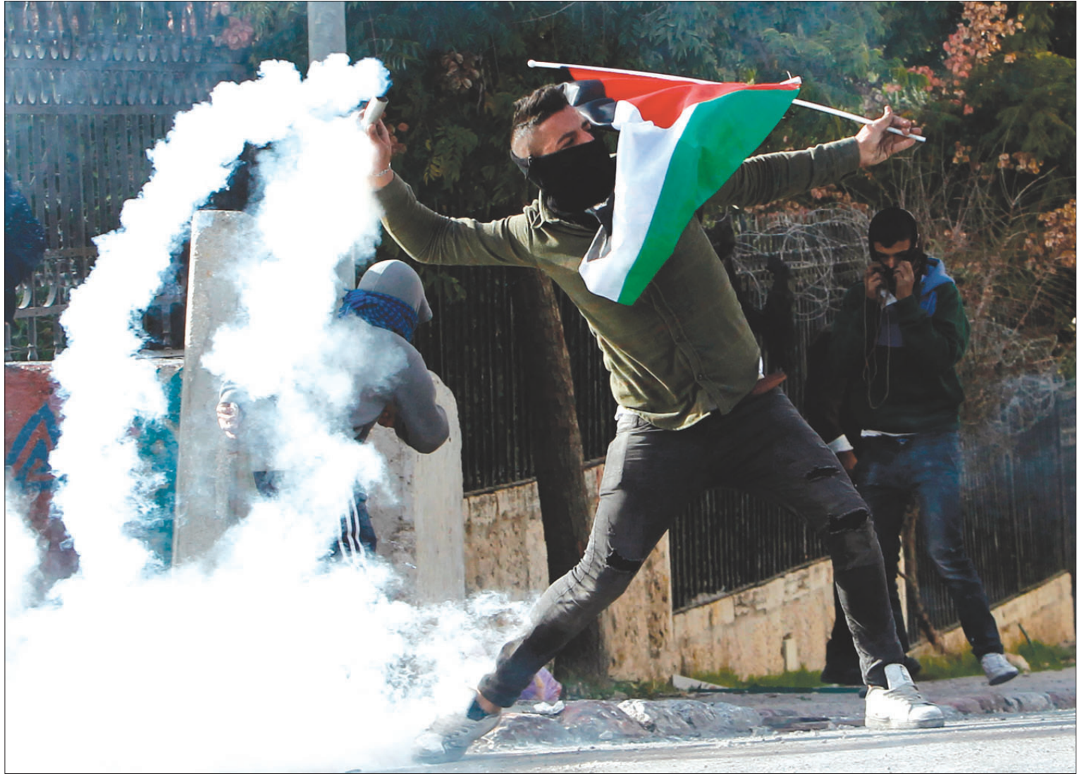
فلسطيني يلقي قنبلة غاز أطلقتها قوات الاحتلال على متظاهرين في بيت لحم أمس

رام الله، كناح زيون الرياض - القاهرة - أنقرة، «الشرق الأوسط»