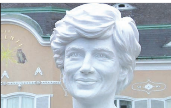
تمثال الأميرة ديانا في فيينا

لندن، «الشرق الأوسط» وقع الاختيار على النحات الذي نحت صورة الملكة إليزابيث المستخدمة على العملات المعدنية البريطانية، لنحت تمثال جديد للأميرة ديانا، تخليداً للذكرى العشرين لوفاتها، حسب ما قاله مكتب الأمير ويليام وشقيقه الأصغر هاري، أمس. ويصمم إيمان رانك برودي، الذي ظهر التمثال الذي نحتته للملكة على العملات في أنحاء المملكة المتحدة والكومنولث منذ 1998، التمثال الذي لن يكشف النقاب عنه قبل 2019، حسب «رويترز». وقال الأميران ويليام وهاري، في بيان: «إيمان نحات موهوب، ونعرف أنه سيدع تركيزاً مناسباً دائماً لأمنا». وفي يناير (كانون الثاني) قرر