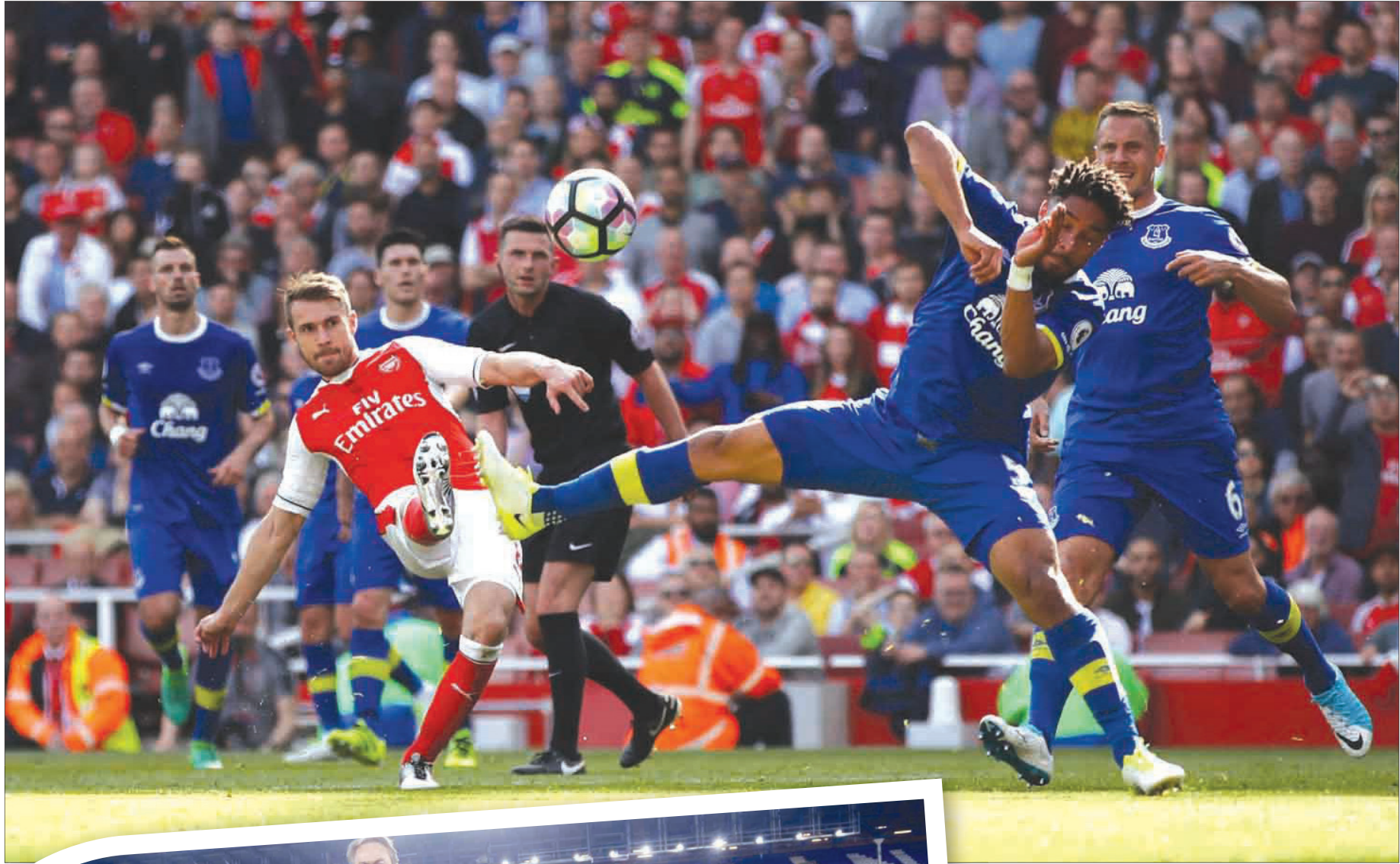
لقطة من مباراة آرسنال وإيفرتون الذين دخلوا في تحقيقات بشأن الشراكة المالية لملك الأسمم

أيضاً، تسلط الوثائق الضوء على أدوات الملكية التي لا يراها الرأي العام، والهياكل «أوفشور»