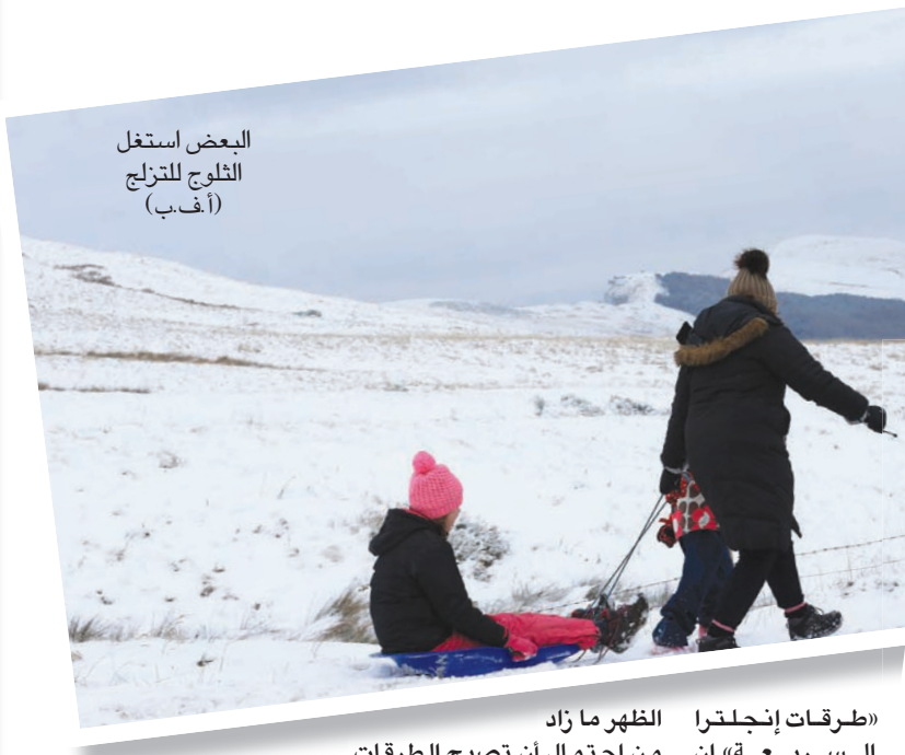
البيعض استغل الثلوج للترليج

تسببت أكبر موجة تساقط ثلوج في المملكة المتحدة منذ أربع سنوات بالضربات واسعة أمس. وأدت الثلوج إلى سد الطرقات واضطرت حركة الملاحة الجوية بعدما أغلقت مدارج مطارات. وعلق الطيران من مطار برمنغهام الذي يخدم ثاني أكبر مدن البلاد جميع الرحلات صباح أمس فيما عمل الموظفون على فتح المدرج وسط تساقط كثيف للثلوج. وقالت ناطقة باسم المطار الفرنسية إنه يتوقع أن يعاد فتحه بعد الظهر. وأضافت أن المطار الذي يستقبل عادة 30 ألف مسافر ومائتي رحلة في اليوم خلال شهر ديسمبر (كانون الأول)، حول 11 رحلة