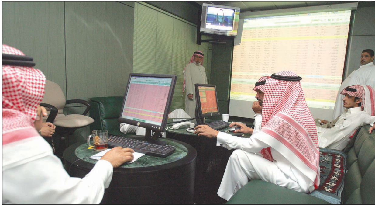
أنشطة الاكتتاب في المنطقة مدفوعة بشكل أساسي بثلاثة اكتتابات عامة في السوق المالية السعودية («الشرق الأوسط»)

شهدت منطقة الشرق الأوسط وشمال أفريقيا خمس صفقات اكتتاب خلال الربع الثالث من العام الحالي، بقيمة بلغت 236,7 مليون دولار، بزيادة نسبتها 20 في المائة عن نفس الفترة المقارنة من العام الماضي. وكانت أنشطة الاكتتاب في المنطقة مدفوعة بشكل أساسي بثلاثة اكتتابات عامة في السوق المالية السعودية (السوق الرئيسية) بقيمة إجمالية بلغت 206,8 مليون دولار، وحقق صندوق «مشاركة ريت» أكبر صفقة اكتتاب في الربع الثالث من عام 2017 بقيمة 95,1 مليون دولار، بينما سجلت شركة «زهرة الواحة» للتجارة ثاني أكبر صفقة اكتتاب بقيمة 62 مليون دولار، تلاها صندوق «العذر ريت» مع صفقة اكتتاب بقيمة 49,7 مليون دولار.