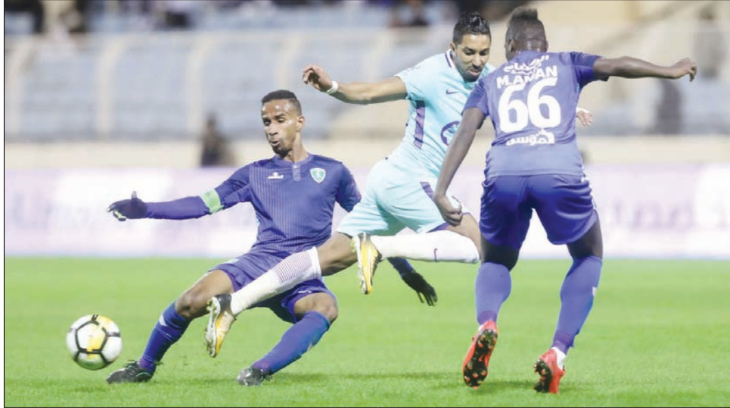
لاعبو الفتح استطاعوا إيقاف انتصارات الهلال في الدوري أمس