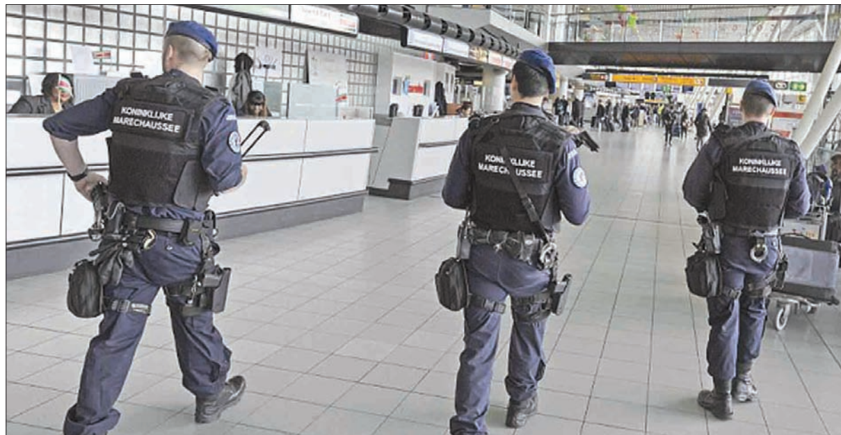
جنود من الشرطة البلجيكية في دورية أمنية بمطار بروكسل عقب هجمات العام الماضي

مطلعا بشكل جيد على الأمن بمطار بروكسل الوطني، حسب جنسيتها الأصلية كان قد مارس ضغوطا داخل الشركة التي يعمل بها من أجل الدفع باتجاه توظيف أشخاص ينتمون إلى دول شمال أفريقيا، وجرى اكتشاف شخص منهم متورط في أنشطة إجرامية. وقال الإعلام البلجيكي إن السلطات تراقب عددا كبيرا من العمال في مختلف مطارات البلاد على أثر شكوك حول صلاتهم بجموعات متطرفة. وكانت بلجيكا قد شهدت هجوما إرهابيا استهدف مطار بروكسل وإحدى محطات القطارات الداخلية في مارس من العام الماضي، وأسفر عن مقتل 32 شخصا وإصابة 300 آخرين، وبعد 4 أسابيع من التفجيرات قالت القناة التلفزيونية الفلامانية «في تي إم»، إن نجيم العشراوي، أحد الانتحاريين الذين نفذوا هجوم مطار بروكسل، كان قد عمل لخمس سنوات بهذا المطار. وكان يعمل بموجب عقد عمل مؤقت لصالح شركة نشطة بالموقع، وبالتالي فالرجل كان مطلعاً على إجراءات المطار، وشارك في عمليات الصيانة، ونقلت وسائل الإعلام عن مصادر مطلعة ومقرية من الملف أن عمليات المراقبة اليومية البلجيكية على مواقعها الإلكترونية إن الشخص الذي اعتقلته الشرطة كان يعمل لصالح شركة وسيطة توفر العمال والأشخاص الذين يقومون