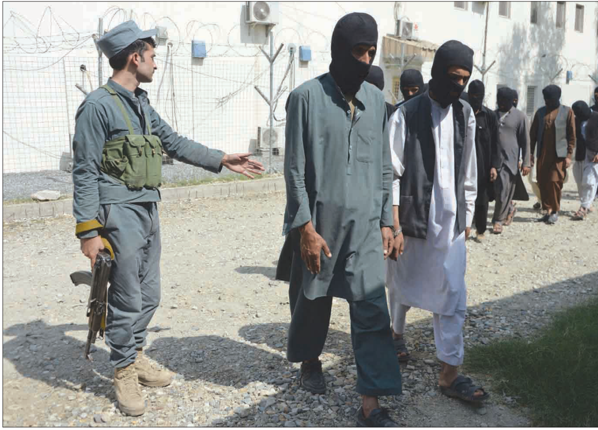
عناصر من «داعش» أمام عدسات المصورين عقب اعتقالهم في جلال آباد في أكتوبر الماضي (إ.ب.أ)

بعد اتهامات باغتصاب خصم، واستقر في تركيا منذ مايو (أيار) للدواع طيبة». وفي جوزجان قتل ستة عاملين لدى اللجنة الدولية للصليب الأحمر في كمين في فبراير (شباط)، ولم تعلن أي جهة مسؤوليتها عن ذلك.