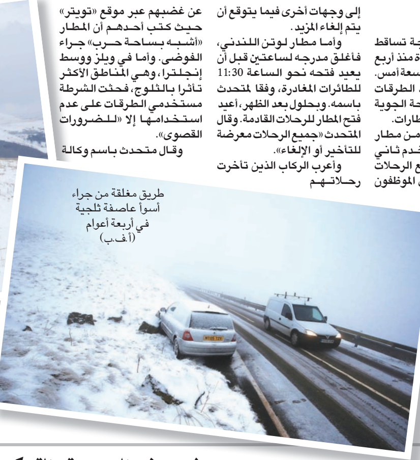
طريق مغلقة من جراء أسوأ عاصفة ثلجية في أربعة أعوام

«طرقات إنجلترا السريعة» إن حوادث مرورية وقعت في كل أنحاء المنطقة». واستمر تساقط الثلوج خلال فترة بعد