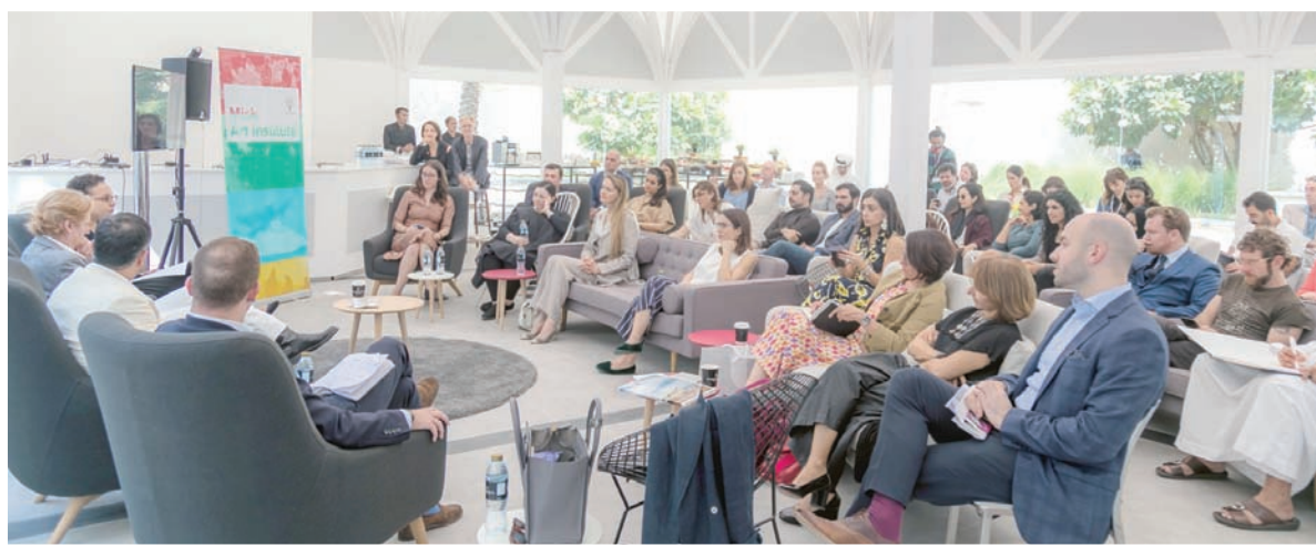
جانب من الندوة التي أقامها مركز مسك للفنون على هامش أرت أبوظبي الشهر الماضي

والآن، ومن خلال دوره الجديد، يأخذ هذا الهدف ليجعله استراتيجية عمل للمعهد، فيقول: «أيضاً، عندما نعمل مهرجان عربي في نيويورك، ومعارض في فرنسا ولندن، ومعرض متجول، وهو (طريق البخور) الذي سيكون معرضاً دائماً تعرض من خلاله الفنون والعمارة والسينما والموسيقى والمسرح: «الدنيا منصتنا هناك. الآن، السعودية جزء من ثقافة العالم، فالسعودية تستشارك في بينالي البندقية بكل أفرعه عن طريق مركز مسك، المنبثق من مؤسسة مسك الخيرية، وهي المظلة الرئيسية».