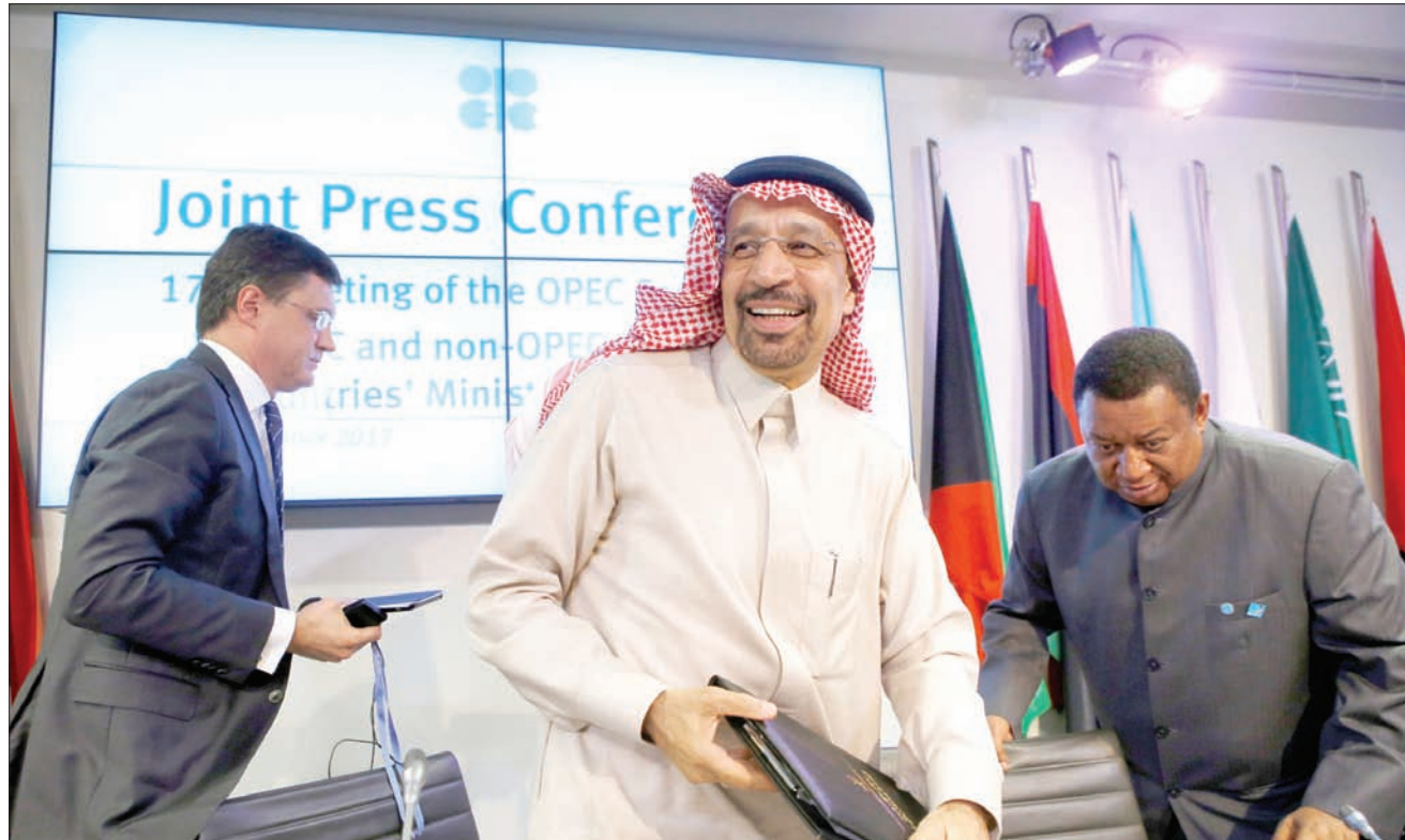
وزير الطاقة السعودي خالد الفالح ونظيره الروسي (يسار) وأمين عام «أوبك» عقب مؤتمر صحفي مشترك

ارتفعت العقود الآجلة للنفط أمس (الجمعة) بعدما اتفقت «أوبك» وكبار المنتجين خارجها على تمديد تخفيضات الإنتاج، في خطوة كانت متوقعة على نطاق واسع، وتهدف إلى تصريف التخمّة المستمرة في المعروض العالمي. واتفقت منظمة البلدان المصدرة للبترول (أوبك) وبعض المنتجين المستقلين بقيادة روسيا أول من أمس (الخميس) على إبقاء تخفيضات الإنتاج حتى نهاية 2018، بينما أشاروا إلى احتمال الخروج من الاتفاق مبكراً إذا شهدت السوق ارتفاعات موسومة في الأسعار. ويحلول الساعة 0635 بتوقيت جرينتش، زاد الخام الأميركي في العقود الآجلة 17 سنتاً أو 0,3 في المائة إلى 57,57 دولار للبرميل. وارتفع خام القياس العالمي مزيج برنت في العقود الآجلة تسليم فبراير (شباط) 24 سنتاً إلى 62,87 دولار للبرميل.