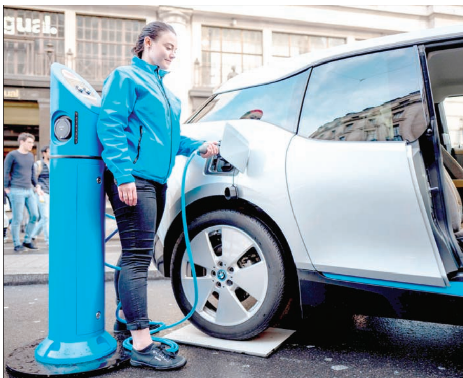
برلين، اعتدال سلامة

على صعيد ألمانيا، تخطط شركة «إيون» لاستثمار نحو 300 مليون يورو لغاية عام 2020، ثم 200 مليون يورو إضافية بحلول عام 2022، من أجل بناء أكثر من 2000 محطة شحن كهربائية على الطرق السريعة الرئيسية وفي بعض الطرق الرئيسية الأخرى. واعتماداً على قوانين تنظيمية أوروبية، ينبغي على كافة المجمعات السكنية الألمانية التي تتخطى مساحتها ثلاثة كيلومترات مربعة أن يكون لديها محطة شحن كهربائية واحدة على الأقل. وستتبنى حكومة برلين هذا القانون الجديد اعتباراً من مطلع العام المقبل.