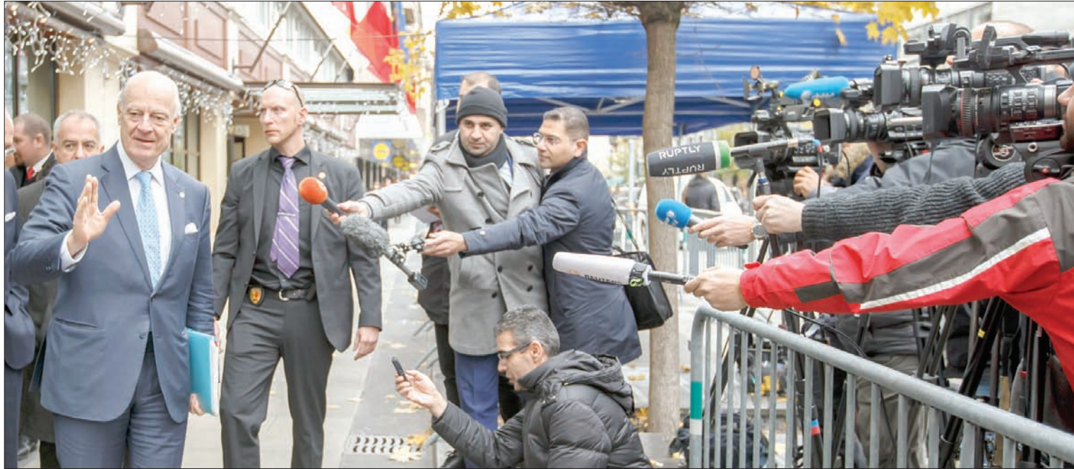
دي ميستورا يتحدث إلى الصحفيين في جنيف أمس

وقال الجعفري إن تقديم دي ميستورا ورقته «من دون استشارة» الأطراف هو «تجاوز» لمهمته كمبعوث دولي. إضافة إلى انتقاده دور المبعوث لأنه لم يُزَم «الهيئة» بالتراجع عن موقفها السياسي من المطالبة بخروج الرئيس بشار الأسد «عند بدء المرحلة الانتقالية». وقال: «هذا شرط مسبق، في وقت يفترض أن تكون المفاوضات فيه من دون شروط مسبقة».