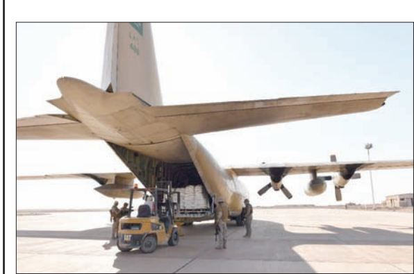
أول طائرة محملة بالمساعدات تحط في مطار الفيضة

الرياض: «الشرق الأوسط» أعلن مصدر رسمي في قيادة قوات التحالف (تحالف دعم الشرعية في اليمن) أنه بالتنسيق مع الحكومة الشرعية في اليمن تم تشغيل مطار الفيضة في محافظة المهرة باليمن، لاستقبال الطائرات التي تحمل مساعدات إغاثية إنسانية، وأفاد المصدر، بوصول أولى طائرات القوات الجوية الملكية السعودية، أول من أمس، محملة بـ5 آلاف سلة غذائية مقدمة من مركز الملك سلمان للإغاثة والأعمال الإنسانية، وأكد أن قوات التحالف قامت بتسيير الإمكانات كافة، للإسهام في إيصال المساعدات الإنسانية والمساعدات الإغاثية إلى اليمن. المسؤولون في الدخول اليمني، إلى ذلك، نوهوا بالكويتي عبد الله الربيعي المستشار بالديوان الملكي المشرف العام على مركز