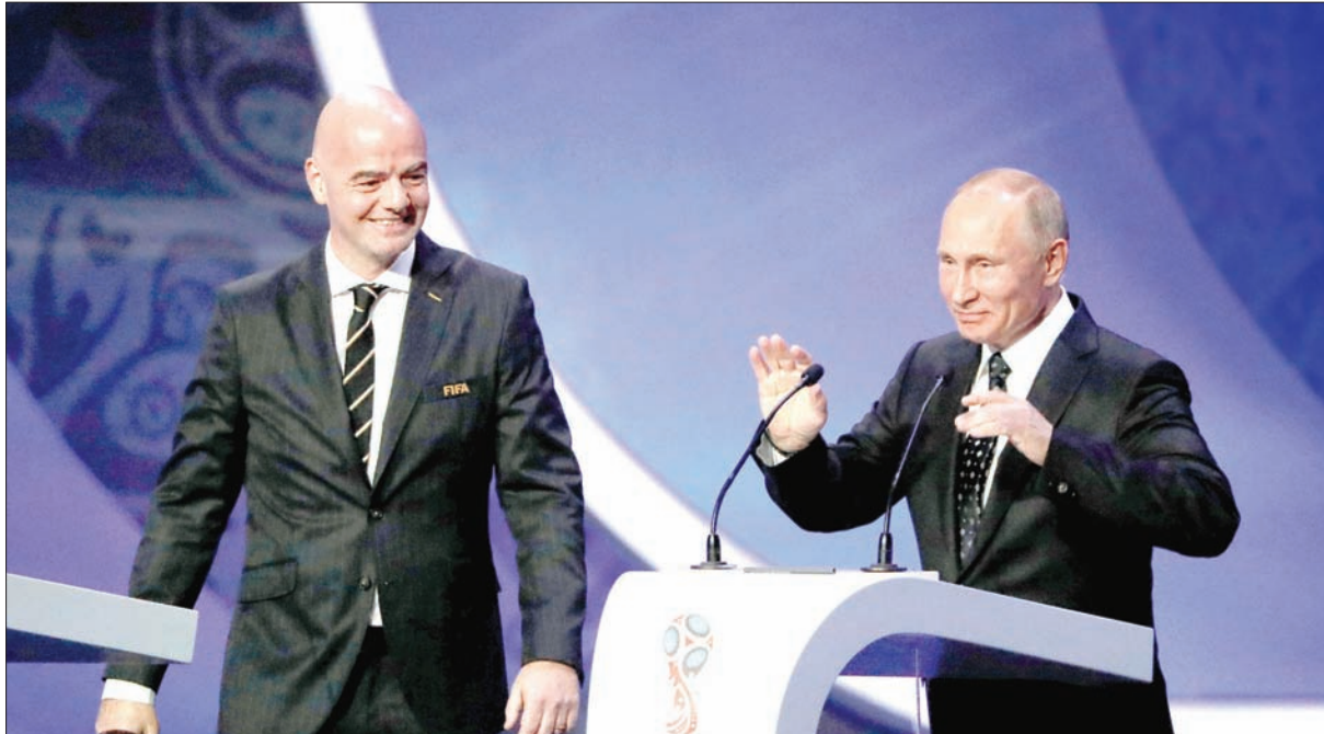
الرئيس الروسي بوتين وإفانتينو رئيس «فيفا»