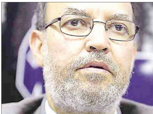
القيادي الإخواني عصام العريان (الشرق الأوسط)

والحجاز للخدمات العقارية والتسويق، والأندلس والحجاز للتنمية السياحية، والمصرية القطرية، والتيسير، وكيما للتجارة والمقاولات، وبلوجان للفنادق... وجميع هذه الشركات والكيانات تعمل وتدار بشكل طبيعي ومعتاد، إن لم يكن على نحو أفضل». مؤكداً أن التحفظ على الأفراد والشركات والكيانات، يشمل المنع من التصرف في كل ممتلكاتهم العقارية والمنقولة وأموالهم السائلة، سواء كانت مملوكة لهم ملكية مباشرة أو غير مباشرة، وكذا منعهم من التصرف في جميع حساباتهم المصرفية أو الودائع أو الخزائن أو السندات أو الأوراق المالية أو أدوات الخزائنة المسجلة باسمائهم طرف أي من البنوك الخاصة لرقابة البنك المركزي المصري.