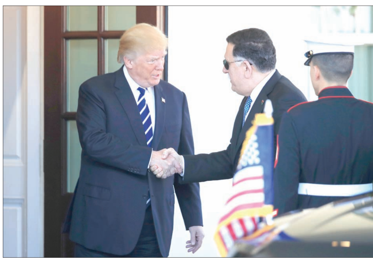
الرئيس الأميركي دونالد ترمب مستقبلاً فايز السراج في البيت الأبيض أمس (أب)

وستساعد هذه المجموعة، حسب الأوروبيين، في تسهيل وتوسيع أطر التعاون بين أطرافها والمنظمة الدولية للهجرة والمفوضية العليا لشؤون اللاجئين، اللذين تعملان على معاينة أوضاع المهاجرين على التراب الليبي. ويقر الاتحاد الأوروبي بصعوبة الوصول إلى كافة مراكز الاحتجاز في ليبيا، بسبب ضغوط الكثير منها لسيطرة أطراف خارجة عن سلطة الحكومة المعترف بها دولياً في طرابلس؛ ولذلك يعول على مجموعة العمل الجديدة حتى يتمكن من الوصول إلى عدد أكبر من المهاجرين. وكان الاتحاد الأوروبي قد أعلن عن نيته استئناف نحو 50 ألف طالب لجوء أفريقي من ليبيا على أراضي دوله المختلفة؛ «لكن