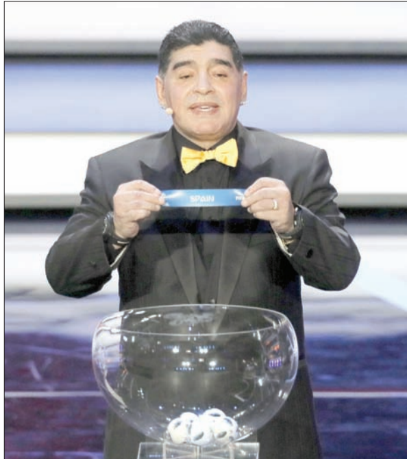
الأسطورة مارادونا يشارك في مراسم إجراء القرعة

العاصمة الروسية موسكو، ثم يلتقي نظيره السويدي والكوري في مدينتي سوتشي وكازان. وقال يواخيم لوف، مدرب ألمانيا: «إنها مجموعة مثيرة جداً، وما نود فعله في دور المجموعات هو الانطلاق بشكل ناجح في حملة الدفاع عن اللقب». وقال راينارد جريندل رئيس الاتحاد الألماني للعبة: «إنها مجموعة مثيرة للغاية، وتشكل تحدياً أمام فريقنا. الاستعداد للمباريات الثلاث في دور المجموعات بدأ من الآن». وقال مانويل نوير، حارس ألمانيا: «تلعب المسكبة كرة حماسية، ويمكننا التعامل جيداً مع السويد، ونذكر ما يمكننا فعله بعدما أطاحت بإيطاليا. كوريا الجنوبية منتخب قوي». وأسفرت القرعة أيضاً عن وقوع منتخبات فرنسا وأستراليا وبيرو والدنمارك في المجموعة الثالثة، والأرجنتين وأيسلندا وكرواتيا ونيجيريا في المجموعة الرابعة، والبرازيل وسويسرا وكوستاريكا وصربيا في المجموعة الخامسة، وبولندا والسنتال وكولومبيا واليابان في المجموعة الثامنة. وقال ديفيو مارادونا، قائد الأرجنتين السابق: «البيست مجموعة سيئة على الإطلاق. يجب أن تتحسن الأرجنتين، ولا يمكن أن نلعب بشكل سيئ كما يحدث». وقال والتر كاساغراندي، مهاجم البرازيل السابق: «إنها مجموعة جيدة كعداداً، وتشكل إعداداً جيداً للدور الثاني». وقال فلاديمير بتكوفيتش، مدرب سويسرا: «البرازيل ليست منافسة الوحيدة، وستكون بقية المواجهات صعبة». وأضاف: «يجب أن نستعد لمنتخب كوستاريكا، فهو منافس خطير، كما تتفتح صربيا دائماً بمهارات فريدة جيدة، وفي الوقت الحالي نجحت في تشكيل مجموعة جيدة».