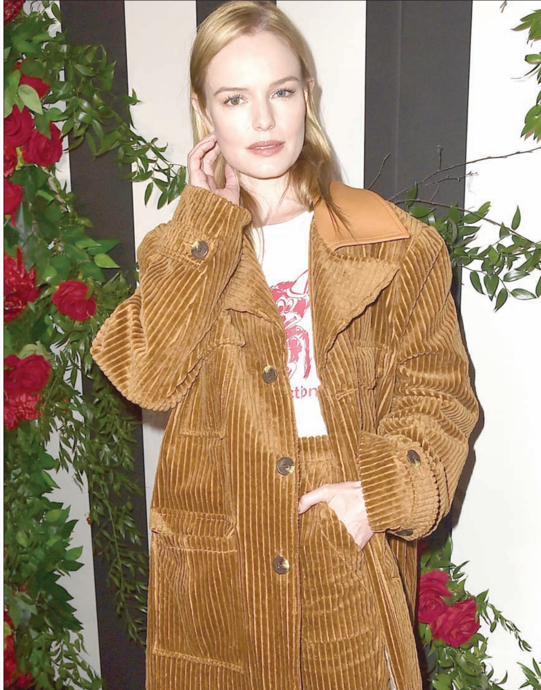
المثلة كيت بوزورث أثناء حضورها فعالية «لاند أوف دستراكتشن» في لوس أنجلوس بكاليفورنيا أول من أمس (أ.ف.ب)

ولا أستبعد أنه من شدة محبته لي تأثر بي، وأخذ يقلدني، وكلنا في الهوا سوا.