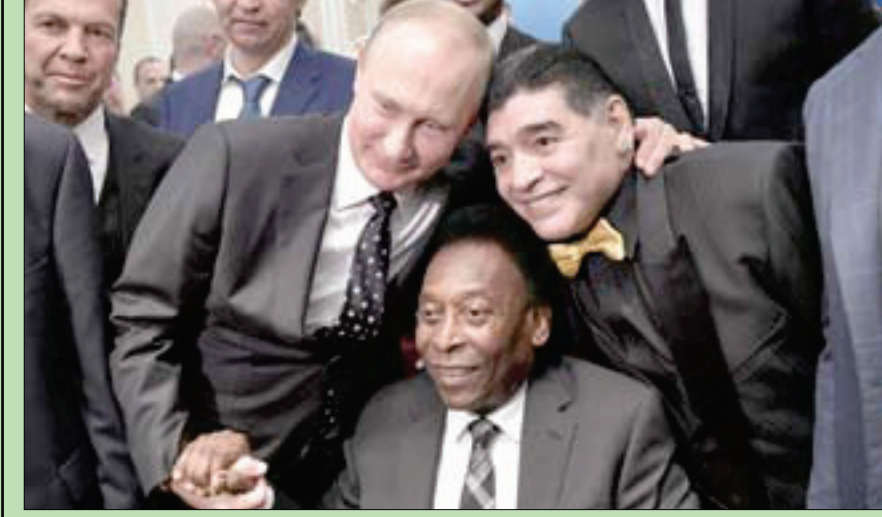
الرئيس الروسي فلاديمير بوتين يلتقط صورة مع أسطورتى كرة القدم البرازيلي بيليه والأرجنتيني دييغو مارادونا قبل سحب قرعة كأس العالم في الكرملين أمس

جنيف - بيروت - لندن، «الشرق الأوسط» أعلن الخميس توقف جولة المحادثات لثلاثة أيام بدءاً من السبت على أن تستأنف الثلاثاء حتى منتصف الشهر الحالي. وبعد لقائه دي ميستورا الجمعة، حمل الجعفري في أول تصريحاته للصحافيين منذ وصوله إلى جنيف، على خطاب وفد المعارضة الموحد ودي ميستورا. وقال إن تقديم المبعوث الدولي ورقة مبادئ سياسية - نشرتها «الشرق الأوسط» أول من أمس - من دون التشاور مع دمشق «تجاوز لولايتته». واشترط أن يقدم دي ميستورا ردوداً على ورقة سابقة