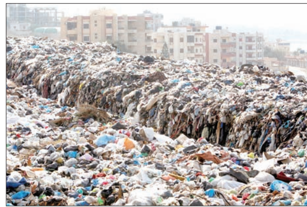
صورة أرشيفية لمكب نفايات في منطقة الجية

يقدر أن 10 إلى 12 في المائة فقط من نفايات لبنان لا يمكن إعادة تدويرها أو تحويلها إلى سماد عضوي. وحضت المنظمة السلطات اللبنانية على «تبني خطة طويلة الأمد لإدارة النفايات في البلد بأكملها، تأخذ بعين الاعتبار الآثار البيئية والصحية المرافقة». وقال نديم حوري، المدير المؤقت لمكتب «هيومن رايتس ووتش» في بيروت: «مع كل كيس نفايات يُحرق، يزداد الضرر بصحة السكان المجاورين، لكن السلطات لا تقوم بشيء تقريباً لاحتواء الأزمة. قد يظن البعض أن أزمة النفايات بدأت في 2015، لكن الوضع مستمر منذ عقود، إذ تنتقل الحكومة من خطة طوارئ إلى أخرى، متجاهلة ما يجري خارج بيروت ومحيطها».