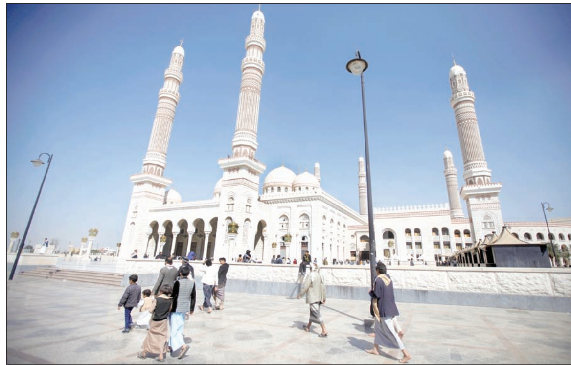
جانب من مسجد الصالح كما بدأ قبل صلاة الجمعة أمس