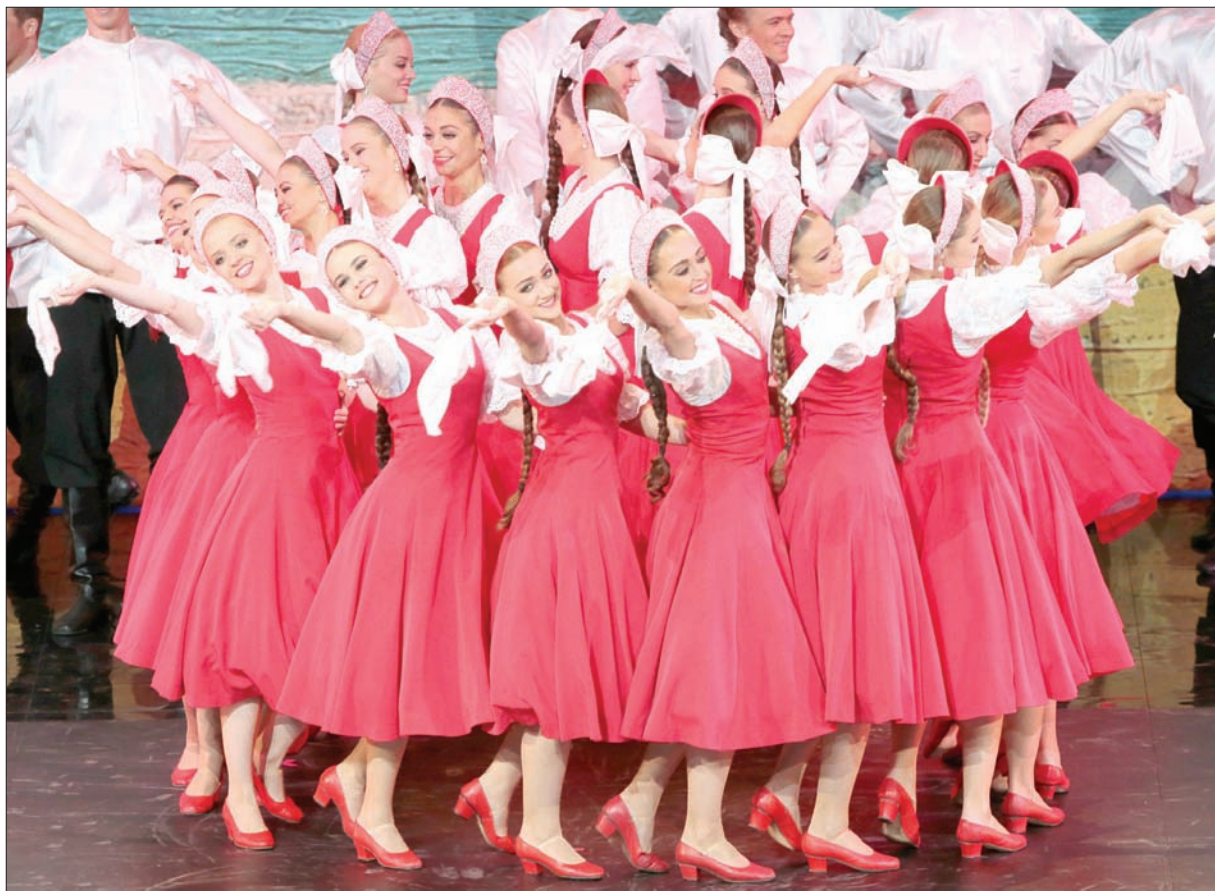
رقصة روسية تقليدية على هامش قرعة المونديال الروسي (أ.ب.)

حسبت قرعة بطولة كأس العالم 2018 لكرة القدم بروسيا، التي سُحبت أمس (الجمعة)، في قصر الكرملين بالعاصمة الروسية موسكو، مجموعات الدور الأول، وفيما يلي مواعيد وأماكن إقامة مباريات المنتخبات العربية الأربعة المتأهلة للمونديال: المنتخب السعودي (المجموعة الأولى): يبدأ مشواره في المونديال من خلال المباراة الافتتاحية أمام المنتخب الروسي، صاحب الضيافة، على ملعب «لوجنيكي» العريق في العاصمة موسكو في 14 يونيو