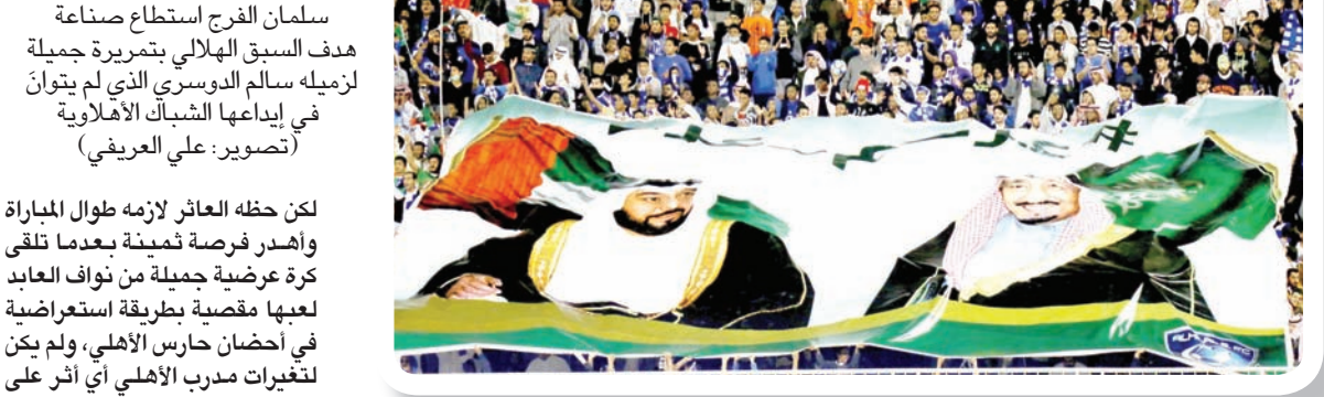
جماهير الكلاسيكو احتفت أمس بذكرى اليوم الوطني الإماراتي

لكن حظه العاثر لازمه طوال المباراة واهدر فرصة ثمينة بعدما تلقى كرة عرضية جميلة من نواف العابد لعبها مقصية بطريقة استعراضية في أحضان حارس الأهلي، ولم يكن لتغيرات مدرب الأهلي أي أثر على أداء الفريق، وظل الفريق بلا هوية بعد الأهداف الهلالية.