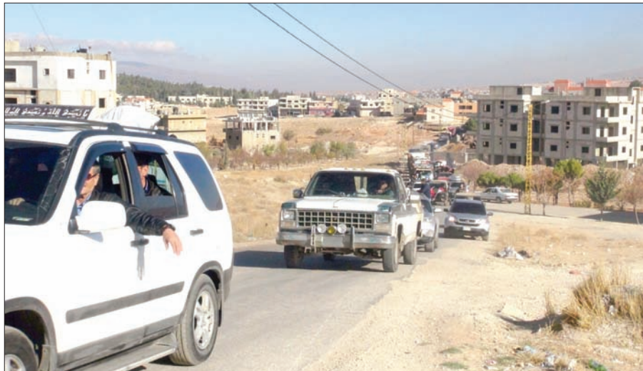
أهالي الطفيل في طريق العودة

الطفيل (الحدود اللبنانية - السورية) حسين درويش