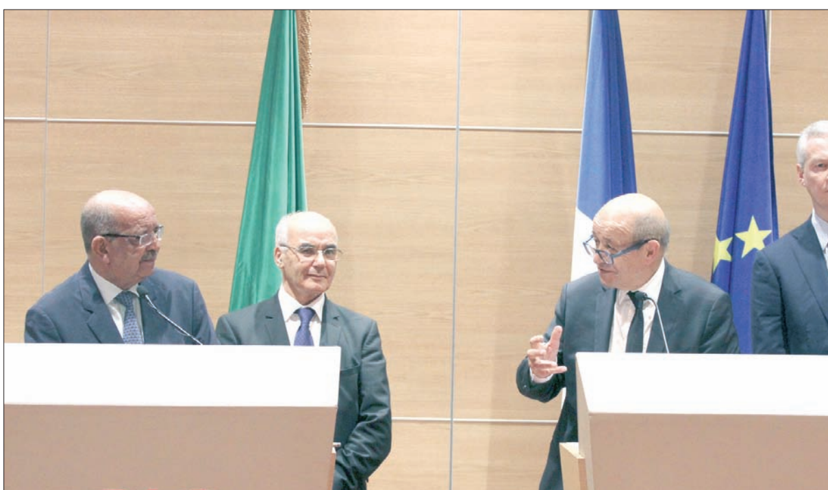
وزير الخارجية الجزائري عبد القادر مساهل (يسار) مع نظيره الفرنسي جان إيف لودريان أثناء مؤتمر صحافي ويبدو بينهما وزير الطاقة الجزائري يوسف يوسف

أضاف بهذا الخصوص: «هناك أدوات للضغط على فرنسا في هذا المجال، أهمها توفر إرادة سياسية لذلك وتفعيلها. وراي أن الإرادة السياسية ضعيفة لدى الجزائريين حتى لا أقول منعدمة، بدليل أن قضية الذاكرة تمت مقايضتها باستثمارات فرنسية، أقصد أن المصالح الاقتصادية قابلها اعتراف رمزي بالماسي التي تكديها الجزائريون، والحقيقة التي كان ينبغي توظيفها لصالحنا كجزائريين، أن تاريخ الاستعمار بالجزائر لا يزال يمزق الطبقة الفرنسية، التي لم تتخلص من عقدها تجاه الجزائر. وهذا المعطى يفترض أن نستفيد منه لافتحاك الاعتراف بال جرائم الاستعمارية، ولكن لن يتحقق ذلك من دون إرادة سياسية لتجريم فرنسا».