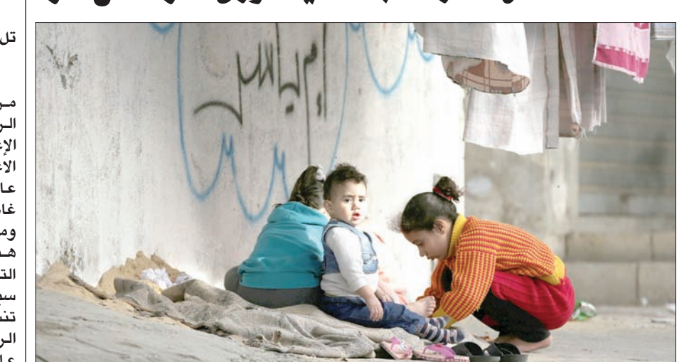
أطفال فلسطينيون يلعبون في مخيم النصيرات في غزة