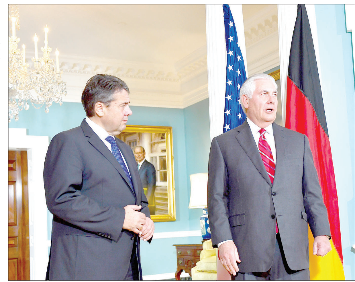
وزير الخارجية ريكس تيلرسون مع نظيره الألماني سيغمار غابريال في واشنطن

والتعاون في أوروبا، على أن يزور باريس في 8 من الشهر نفسه، حيث سيطرق مع مسؤولين فرنسيين كبار إلى ملفات سوريا، وإيران، ولبنان، وليبيا، وكوريا الشمالية ومنطقة الساحل، بحسب بيان لوزارة الخارجية الأميركية. أعلن الاتحاد الأوروبي الجمعة أن ريكس تيلرسون سيجتمع مع نظرائه الأوروبيين الثلاثاء في بروكسل للبحث في العلاقات بين جانبي الأطلسي. وسيعقد هذا اللقاء الذي سيعظم بصيغة غير مسبقة على غداء قبل اجتماع لوزراء خارجية حلف شمال الأطلسي تماما بعد ظهر الثلاثاء. ووجهت الدعوة وزيرة خارجية الاتحاد الأوروبي الإيطالية فيديريكا موغيريني، وكشفت في رسالة الدعوة إلى الوزراء الأوروبيين: «إن التعاون بين جانبي الأطلسي يبقى حجر الأساس لامننا واستقرارنا ورخائنا». وأكدت أن «حوارا مكثفا وشراكة قوية مع الولايات المتحدة أمران أساسيان لهذه الأسباب». ومنذ انتخاب الرئيس دونالد ترمب، تشهد العلاقات بين الولايات المتحدة والاتحاد الأوروبي خلافات عدة حول قضايا، بينها مكافحة تبدلات المناخ والتبادل الحر والاتفاق النووي مع إيران.