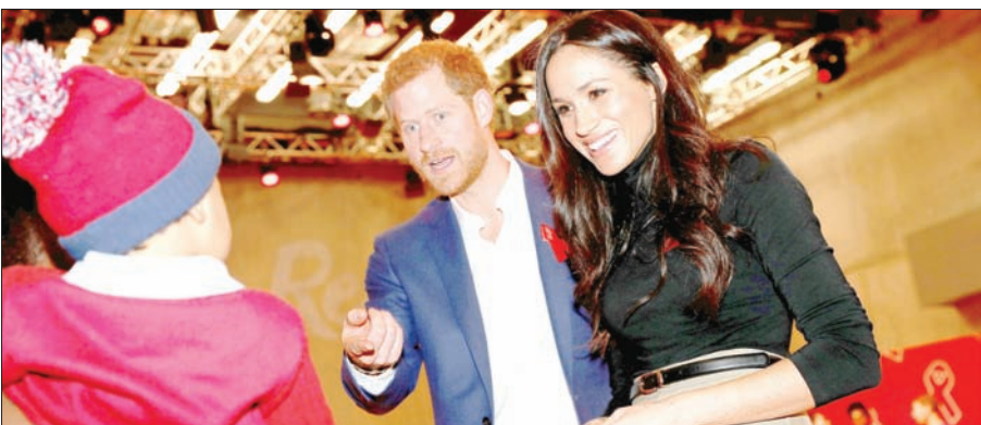
الأمير هاري وخطيبته ميغان أثناء حضورهما بازاراً خرياً في اليوم العالمي للإيدز في توتنغهام أمس

البشرية في منطقة ميدلاندرز، وفق ما نقلت وكالة الأنباء الألمانية. وقال البيان: إن هاري وميغان سيبدآن الزيارة بترحيب مدني في متحف العدل الوطني في توتنغهام «وبليها نزهة، حيث سيتمكنان من مقابلة أفراد الشعب بصفتهم شخصين مرتطمين للمرة الأولى».