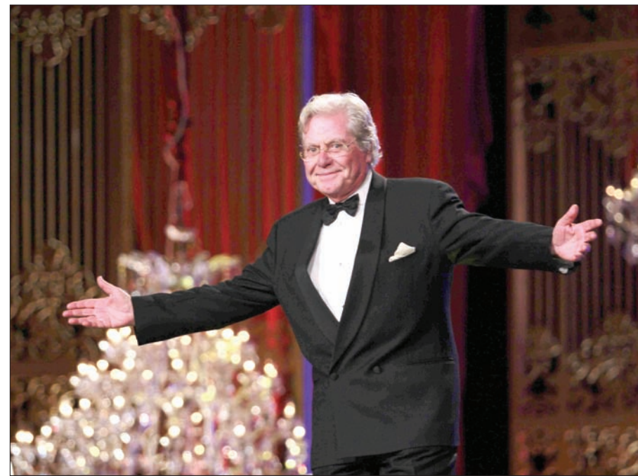
النجم حسين فهمي في ختام مهرجان القاهرة السينمائي