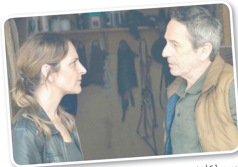
من فيلم «الكلاب» جائزة أفضل سيناريو

أما أدريان برودي فأنجز أوسكاره سنة 2003 عن دوره الأول في «عازف البيانو»، وهو الفيلم الذي منحه أيضاً جائزة سينزاور وجائزة الجمعية الوطنية لنقاد السينما الأميركيين. وفي هذا العام منحه مهرجان لوكارنو «بالم سبرينغز» الأميركي وأخرى مماثلة من مهرجان سان فرانسيسكو في العام ذاته (1998). هذا بجانب أوسكار عن دوره الأول في «مغادرة لاس