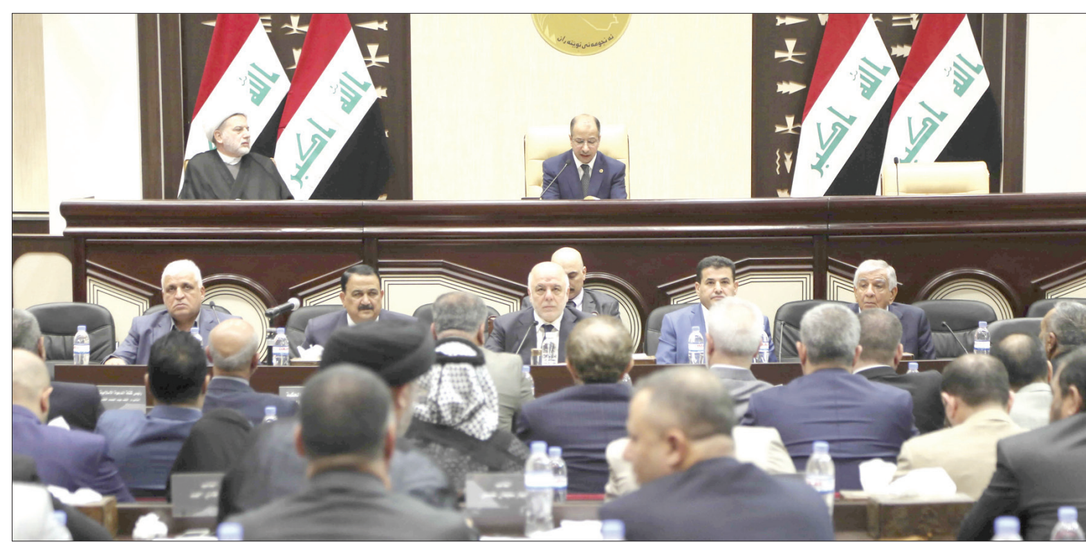
لقطة من جلسة سابقة للبرلمان العراقي بحضور رئيس الوزراء حيدر العبادي

«أن هناك ضغوطات جديدة تمارسها الحكومة الاتحادية ضد إقليم كردستان وهي ضغوطات ناجمة عن تداعيات الاستفتاء العراقي حيث فرضت السلطة الاتحادية ضرائب جمركية كبيرة على السلع والمواد المصدرة من مصانع محافظات الإقليم إلى المحافظات الجنوبية والوسطى في العراق». وقال البيان «إن المصدريين يواجهون ضغوطات كبيرة عند نقل منتوجاتهم من محافظات الإقليم عبر نقطة جمارك (صفرة) قرب منطقة حمرين حيث