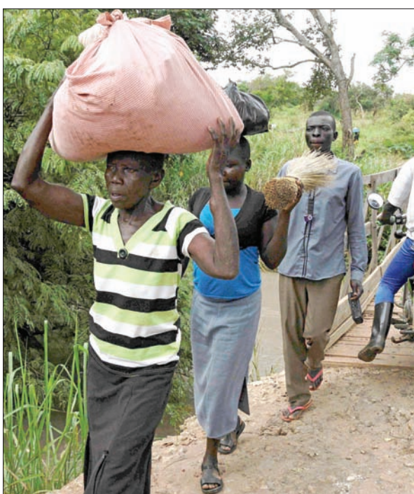
نازحون من جنوب السودان يعبرون نهرًا على الحدود مع أوغندا

سبب لتبقى جانبا»، وأضاف أن جوبا أنجزت عملياً الإجراءات التي تتيح لها أن تصبح عضواً في هذه المنظمة، بحسب بيان صادر عن منظمة حظر الأسلحة الكيميائية. وبدلك تبقى مصر وإسرائيل وكوريا الشمالية الدول الوحيدة التي لم توقع على الاتفاقية التي دخلت حيز التنفيذ عامي 1997. وأضاف أغاوين أن «صور ضحايا الأسلحة الكيميائية تجعلنا جميعاً نقدر بشكل إضافي أهداف وغايات منظمة حظر الأسلحة الكيميائية». وتابع: «لذلك نحن في جنوب السودان نرغب في أن نكون من تحفظ طرفاً مشركاً في الأهداف النبيلة لهذه المنظمة العظيمة».