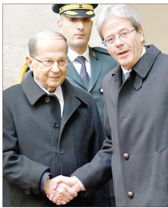
عون مع رئيس الوزراء الإيطالي أسس