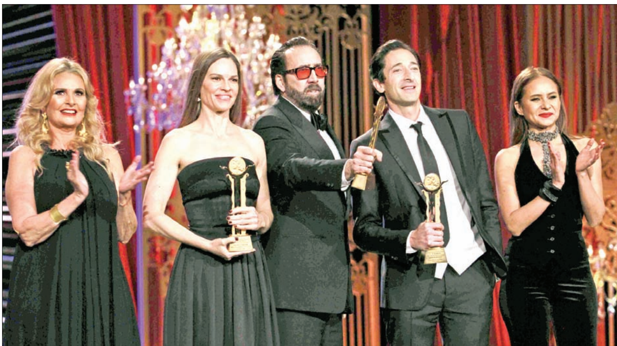
نيلي كريم وأدريان برودي ونيكولاس كيدج والممثلة هيلاري سوانك والنجمة يسرا في حفل الختام