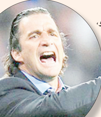
خوان أنطونيو بيتزي مدرب المنتخب السعودي («الشرق الأوسط»)

لمونديال كأس العالم فإنها ستكون مختلفة لكونها تحضر في نهاية شهر رمضان المبارك أو في اليوم الأول من عيد الفطر، وبحسب تقويم أم القرى فإن يوم المباراة سيوافق الثلاثاء من شهر رمضان القادم، إلا أن ذلك سيحدد في وقتها حسب الرؤية لهلال شهر شوال.