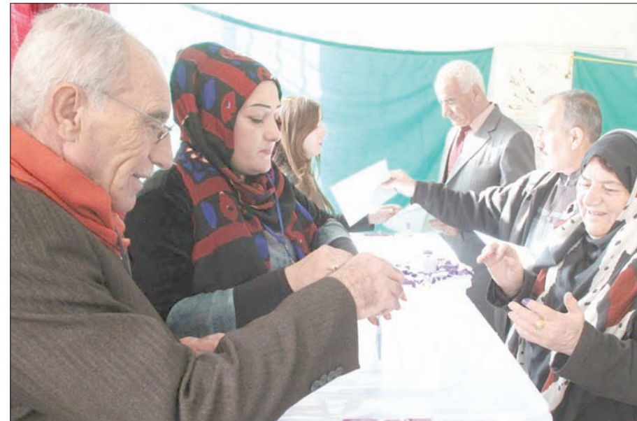
أكراد يقتربون شمال سوريا