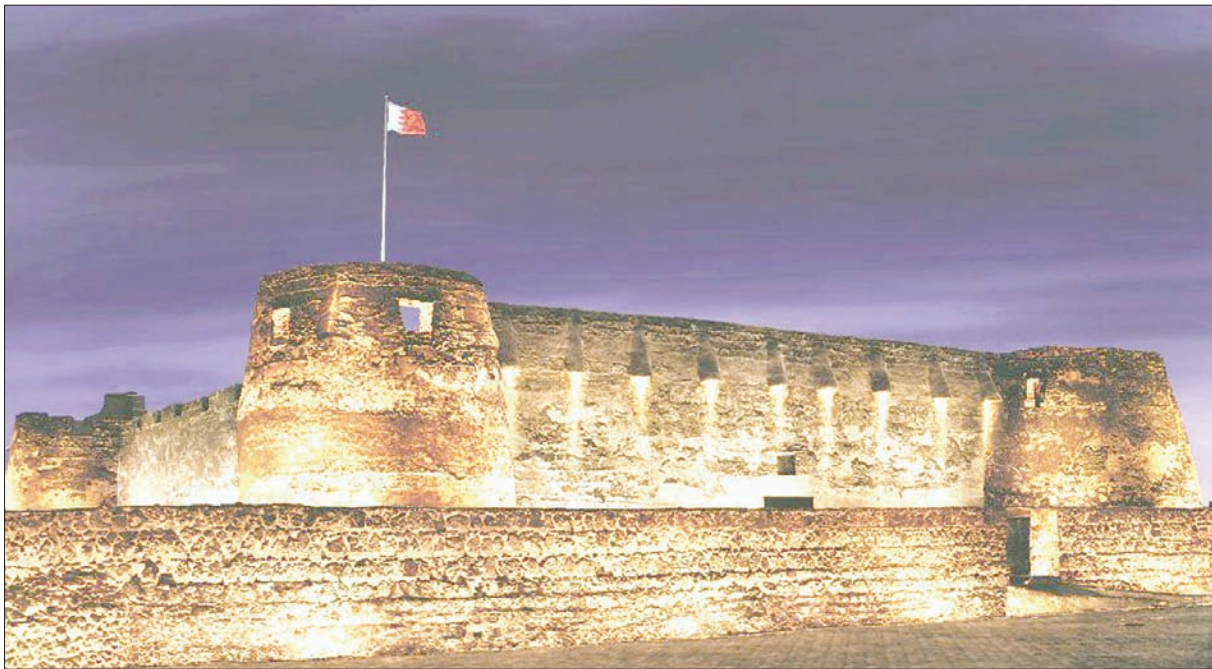
قلعة عراد التاريخية

طوال العام، ودعت زوار القلعة إلى زيارة المواقع الأثرية والمخاضف التي تزخر بها موقع قلعة البحرين، وموقع قلعة بو ماهر، وقلعة الشيخ سلمان بن أحمد الفاتح، وتلال مقابر عالي، ومركز زوار مسجد الخميس، ومعابد باربار، وبيت الجسرة، ومستوطنة سار، والمكتبة الخليفية، ودايرة البريد بالمنامة، وغيرها من المواقع الثقافية.