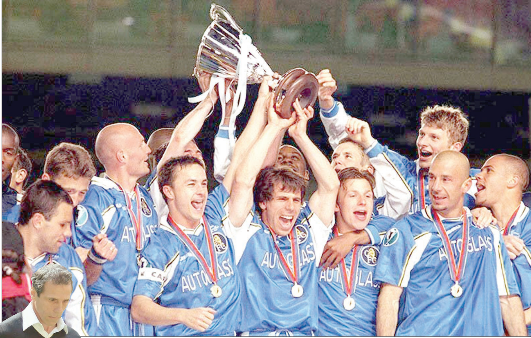
حقق زولا نجاحاً باهراً في مسيرته كلاعب مع تشيلسي («الشرق الأوسط»)

من غير المنطقي في عالم كرة القدم أن تعتقد بأن المدير الفني «المهذب» هو الذي يحقق النجاح، وهناك الكثير والكثير من الأمثلة التي ترد على هذا الادعاء، لكن زولا يرى أن مثل هذا الحديث لا يستحق الرد من الأساس، قائلاً: «في نهاية المطاف، يتعين على كل مستحق الرد أن يتصرف بطبيعته، ولو شعرت بأنه يتعين علي أن أكون عدوانياً دائماً، لكن من المستحيل أن أصل إلى المكانة التي وصلت إليها