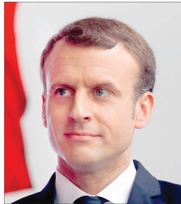
الرئيس الفرنسي إيمانويل ماكرون (أ.ب.)

باريس عارضت انفصال مقاطعة كاتالونيا عن إسبانيا، وبالتالي فإنها تتساءل: «كيف كان لنا أن ندعم انفصال كردستان عن العراق بعد أن رفضنا استقلال كاتالونيا؟» هذه الصفحة قلبت اليوم. وموضوع البحث الذي ستنشره بين بارزاني وماكرون ستنناول بالطبع استمرار الحرب على الإرهاب و«داعش» تحديداً،