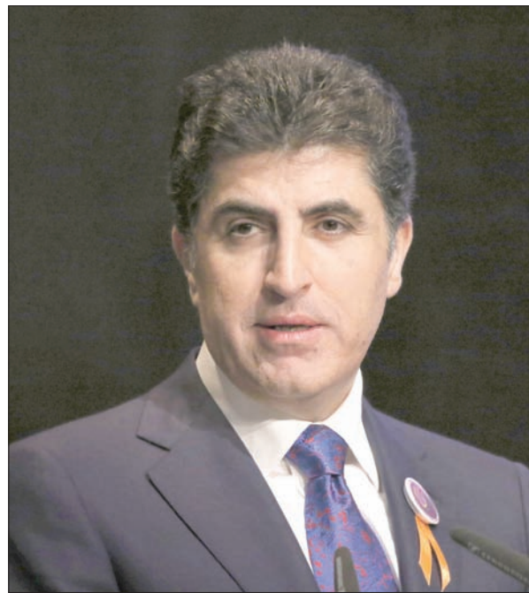
رئيس حكومة إقليم كردستان نيجيرفان بارزاني

باريس، ميشال أبونجم أنقرة، سعيد عبد الرزاق السليمانية، شيرزاد شيخاني في أول زيارة له إلى باريس رئيساً لحكومة إقليم كردستان العراق، تفتح أبواب قصر الإليزيه أمام نيجيرفان بارزاني ونائبه قوباد طالباني، حيث يستقبلهما الرئيس إيمانويل ماكرون قبل ظهر اليوم، في إشارة تدل على التواصل اهتمام باريس بالملف الكردي وسعيها للعب دور الوسيط بين أربيل وبغداد. وما يشير بروتوكولياً إلى رغبة فرنسا في توفير دعم سياسي لإقليم كردستان في مرحلة ما بعد فشل الاستفتاء على الاستقلال واستعادة القوات العراقية المناطق المتنازع عليها والغنية بالنفط، فإن ماكرون وبارزاني سيتحدثان اليوم معاً إلى الصحافة، وهو السيناريو نفسه الذي حصل عندما زار رئيس الوزراء العراقي حيدر العبادي باريس بدعوة من ماكرون في 29 أكتوبر (تشرين الأول) في عز الأزمة بين الحكومتين المركزية والإقليمية. وتعتبر الأوساط الفرنسية أن باريس صلبت صفحة الإقليم السابق مسعود بارزاني بالآ بلحا إليه، ولكنها لم تلتق ذاتاً صاغية رغم الدعم والمساندة