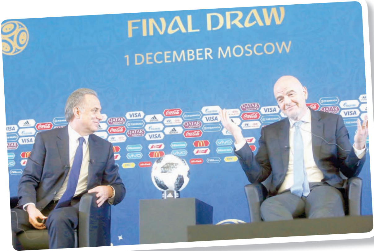
إنفانتينو يتحدث إلى جوار فيتالي موتكو نائب رئيس الوزراء الروس

وبعيداً ذلك من جديد إلى علامات الاستفهام التي تطرح نفسها بشأن مدى كفاءة الرئيس الجديد لـ«الفيفا»، إنفانتينو.