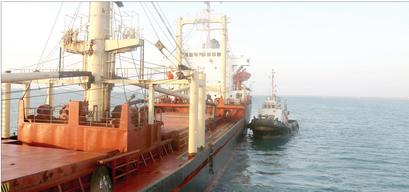
سفينة إغاثية رست بعد فتح التحالف ميناء الحديدة للمساعدات

القدرة العسكرية للجيش اليمني التي سيطر عليها الحوثيون بعيد انقلابهم، المملكة ودول الخليج، وكذلك الأمن الدولي يستخدمون تكتيك «حرب العصابات»، بيد أن مصداً متلعناً أكد أن «الدعم الخارجي