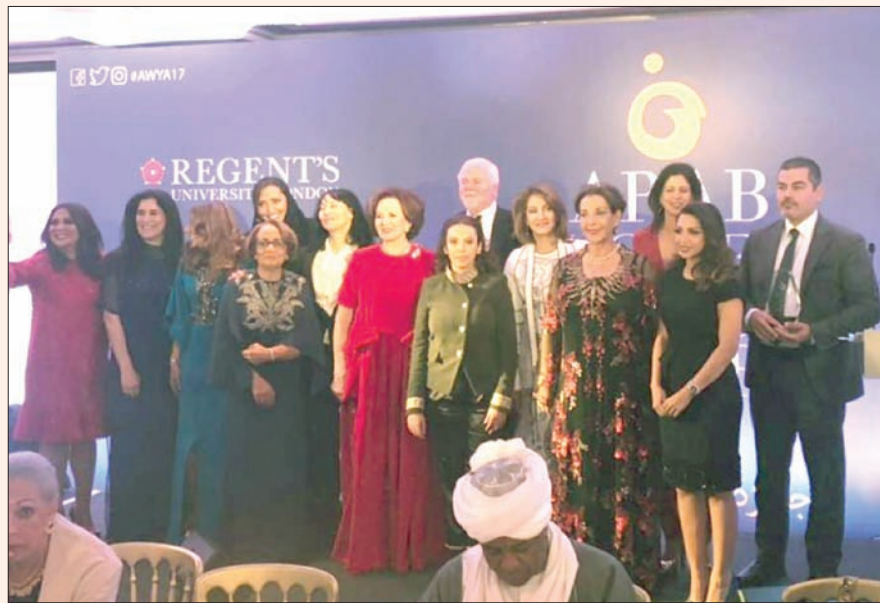
المكرمات في حفل مؤسسة المرأة العربية

العربية» مع 10 سيدات من الدول العربية، تركن أنراً إيجابياً في الساحة الإقليمية والدولية والحياة العامة في المجالات التعليمية والثقافية، وريادة الأعمال، والإعلام، والعلوم، وخدمة المجتمع، والأدب، وغيرها من المجالات. كما نالت الشيخة انتصار سالم العلي الصباح جائزة المرأة العربية، تقديراً لدورها البارز في تعزيز دور المرأة في المجتمع من خلال إطلاقها مبادرة «النور» غير الربحية التي تهدف لنشر الفكر الإيجابي.