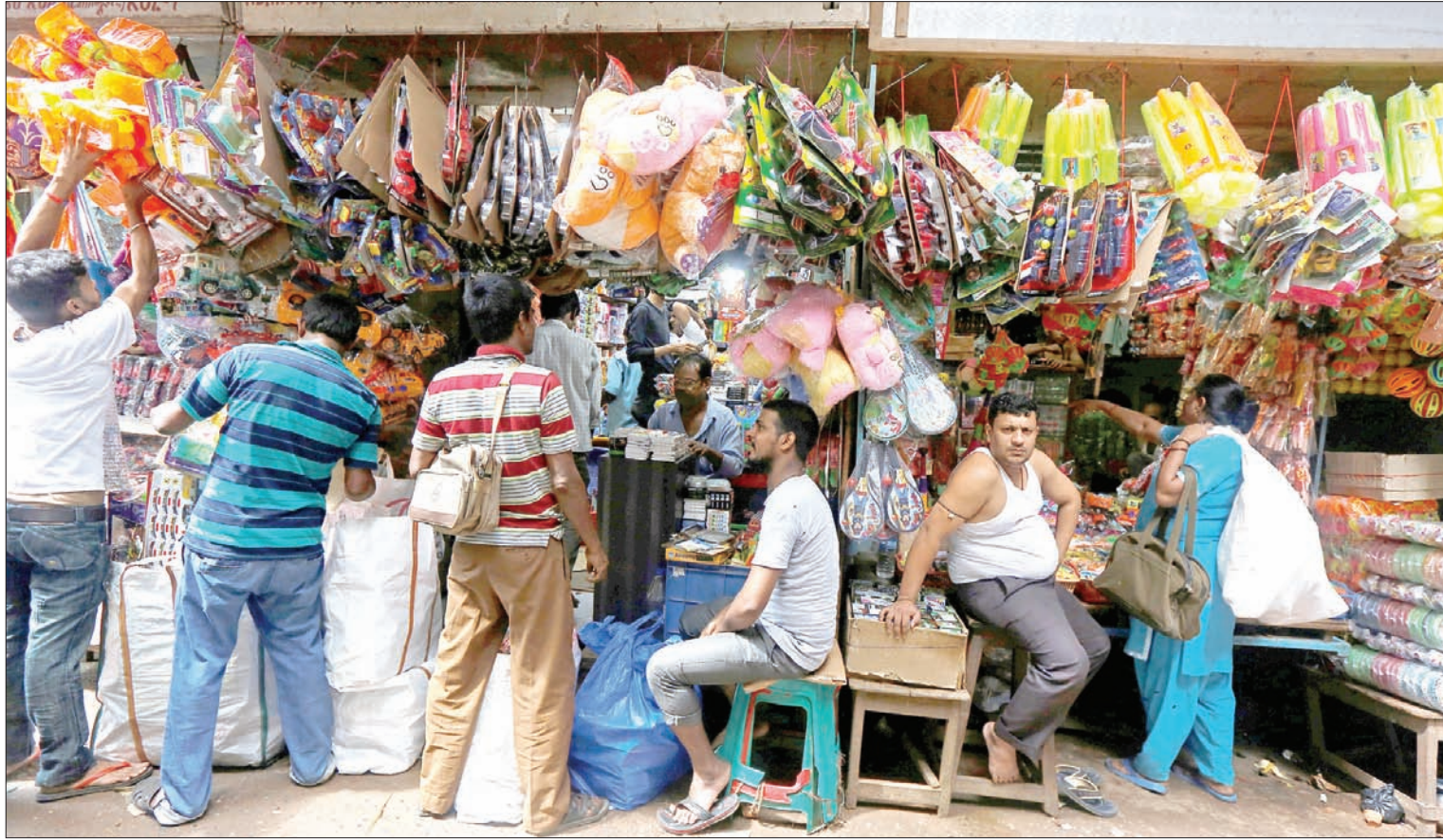
ارتفاع أسعار النفط يؤدي بدوره إلى ارتفاع الأسعار الإجمالية نظراً لارتفاع أسعار النقل والمواصلات

الاستهلاك، وتقلص مجال الاستثمار العام، وانخفاض هوامش الشركات، وزيادة استثمارات القطاع الخاص، ومن شأن نطاق التسهيلات النقدية أن يخضع أيضاً، إذا ما أسفر ارتفاع الأسعار النفطية عن زيادة الضغوط التضخمية».