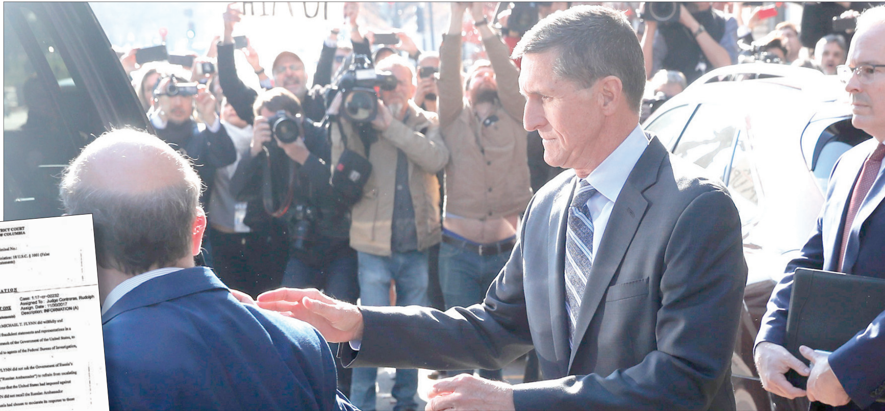
مستشار الأمن القومي السابق مايكل فلين يغادر المحكمة الفيدرالية بواشنطن أمس

وقال البيت الأبيض من أهمية اتهام مستشار الأمن القومي السابق